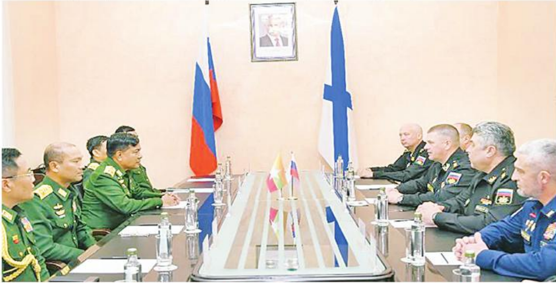
ညှိနှိုင်းကွပ်ကဲရေးမှူး(ကြည်း၊ ရေ၊ လေ) ဝိုလ်ချုပ်ကြီးမောင်မောင်အေးနှင့် ပစိဖိတ်ရေတပ်အကြီးအကဲ Admiral Viktor Nikolayevich Liina တို့ တွေ့ဆုံဆွေးနွေးစဉ်။

နေပြည်တော် အောက်တိုဘာ ၁ - ညှိနှိုင်းကွပ်ကဲရေးမှူး(ကြည်း၊ ရေ၊ လေ) ဝိုလ်ချုပ်ကြီးမောင်မောင်အေးသည် အာဆီယံအပေါင်း အကြမ်းဖက်မှုတန်ပြန်တိုက်ဖျက်ရေးဆိုင်ရာကျွမ်းကျင်လုပ်ငန်းအဖွဲ့၏ မြေပြင်လက်တွေ့လေ့ကျင့်ခန်းသို့ တက်ရောက်ရန် ရုရှားနိုင်ငံသို့ သွားရောက်ခဲ့ရာ စက်တင်ဘာ ၂၅ ရက် နံနက်ပိုင်းတွင် Vladivostok မြို့ အပြည်ပြည်ဆိုင်ရာလေဆိပ်သို့ ရောက်ရှိခဲ့ပြီး ပစိဖိတ်ရေတပ်ဖွဲ့ ဒုတိယအကြီးအကဲ Vice Admiral Denis Berezovsky၊ တပ်မတော်လေ့ကျင့်ရေးအရာရှိချုပ် ဒုတိယ ဝိုလ်ချုပ်ကြီးထိန်ဝင်းနှင့် တာဝန်ရှိသူများက လေဆိပ်တွင် ကြိုဆိုခဲ့ကြသည်။ နေ့လယ်ပိုင်းတွင် အရှေ့ပိုင်းပြည်နယ် တက္ကသိုလ်(FEFU)၌ ပစိဖိတ်ရေတပ်ဖွဲ့သို့ ရောက်ရှိရာ ဒုတိယပါမောက္ခချုပ် Mr. Maxim Vedyashkin Vice-Rector for Campus Management က တက္ကသိုလ်နှင့်ပတ်သက်၍ သင်ကြားပေးသည့် ဘာသာရပ်များ တက်ရောက်နေသည့် ကျောင်းသားကျောင်းသူများနှင့် တက္ကသိုလ်လုပ်ငန်းဆောင်တာများနှင့် ပတ်သက်၍ ရှင်းလင်းပြောကြားသည်။ ထို့နောက် ဒုတိယအကြီးအကဲ Vice Admiral Denis Berezovsky နှင့် တာဝန်ရှိသူများမှ လေ့ကျင့်ခန်းအတွက် FEFU ခန်းမတွင်