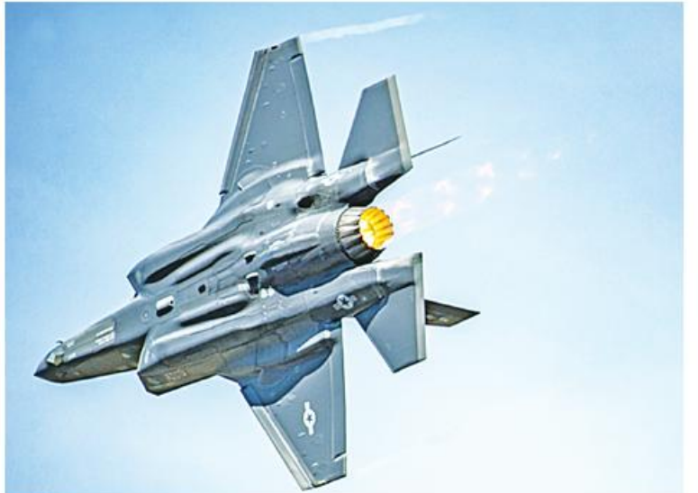
ဟု Fiala က ပြောကြားခဲ့သည်။ US-Made F-35 Fighter Jets ကို Czech Republic to Buy 24 ကိုဘာသာပြန်ဆိုထားပါသည်။

လက်ရှိတွင် ဆွီဒင်ထုတ် Gripen တိုက်လေယာဉ် ၁၄ စင်းကို တပ်ဖြန့်အသုံးပြုထားပြီး အငှားချထားမှုသည် ၂၀၂၇ ခုနှစ်တွင် သက်တမ်းကုန်ဆုံးမည်ဖြစ်ကြောင်း သိရသည်။ လာမည့်နှစ်မှစတင်ကာ အစိုးရသည် ၎င်း၏ NATO အဖွဲ့ ကတိကဝတ်နှင့်အညီ ပြည်တွင်းထုတ်ကုန်စုစုပေါင်း၏ နှစ်ရာခိုင်နှုန်းကို ကာကွယ်ရေးအတွက် သုံးစွဲရန် စီစဉ်ထားသည်။ “ကျွန်တော်တို့ရဲ့ ကာကွယ်ရေးအတွက် NATO မဟာမိတ်တွေနဲ့ ဆက်ဆံရေးကို မြှင့်တင်ဖို့အရေးကြီးပါတယ်။ ဒီအဆင့်နဲ့ ဆိုရင် ကျွန်တော်တို့တိုင်းပြည်ရဲ့ ကာကွယ်ရေးကို အလေးအနက်ထားပြီး သူတို့က ကျွန်တော်တို့နဲ့အတူ လက်တွဲလုပ်ဆောင်လို့ရတယ်ဆိုတာကို သူတို့တွက်ဆလို့ရပါပြီ”