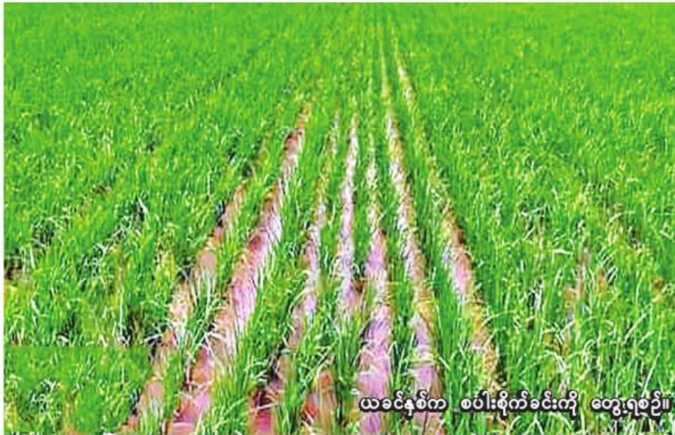
ယခင်နှစ်က စပါးစိုက်ခင်းကို တွေ့ရစဉ်။

ကောလင်း အောက်တိုဘာ ၁ စစ်ကိုင်းတိုင်းဒေသကြီး ကောလင်းခရိုင် ပင်လည်ဘူးမြို့နယ်တွင် ယခုနှစ် မိုးသီးနှံစိုက်ပျိုးရာသီ၌ စပါး ၅၂၇၁၆ ဧက စိုက်ပျိုးပြီးစီးပြီ ဖြစ်ကြောင်း ကောလင်းခရိုင် စိုက်ပျိုးရေးဦးစီးဌာန စာရင်းများအရ သိရသည်။