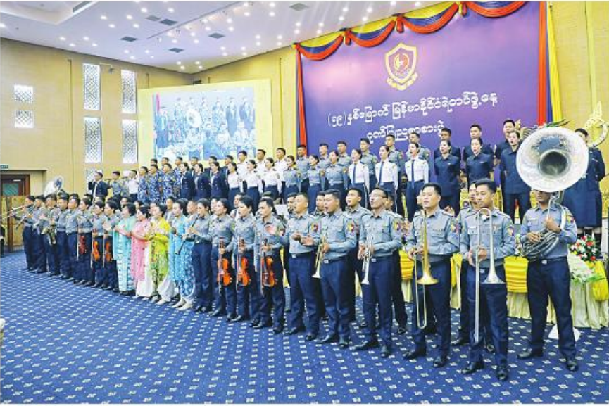
နိုင်ငံတော်စီမံအုပ်ချုပ်ရေး ကောင်စီအဖွဲ့ဝင် ဒုတိယဝန်ကြီးချုပ်နှင့် ပို့ဆောင်ရေးနှင့် ဆက်သွယ်ရေးဝန်ကြီးဌာန ပြည်ထောင်စုဝန်ကြီး ဗိုလ်ချုပ်ကြီးမြထွန်းဦး (၅၉)နှစ်မြောက် မြန်မာနိုင်ငံရဲတပ်ဖွဲ့ နေ့အထိမ်းအမှတ် ဂုဏ်ပြုညစာစားပွဲ အခမ်းအနား တက်ရောက်စဉ်။

နေပြည်တော် အောက်တိုဘာ ၁ (၅၉)နှစ်မြောက် မြန်မာနိုင်ငံရဲတပ်ဖွဲ့ နေ့အထိမ်းအမှတ် ဂုဏ်ပြုညစာစားပွဲ အခမ်းအနားကို ယနေ့ ည ၇ နာရီတွင် နေပြည်တော်ရှိ မြန်မာအပြည်ပြည်ဆိုင်ရာ ကွန်ဗင်းရှင်းဗဟိုဌာန-၂ (MICC-2)၌ ကျင်းပရာ နိုင်ငံတော်စီမံအုပ်ချုပ်ရေး ကောင်စီအဖွဲ့ဝင် ဒုတိယဝန်ကြီးချုပ်နှင့် ပို့ဆောင်ရေးနှင့်ဆက်သွယ်ရေးဝန်ကြီးဌာန ပြည်ထောင်စုဝန်ကြီး ဗိုလ်ချုပ်ကြီးမြထွန်းဦး တက်ရောက်သည်။