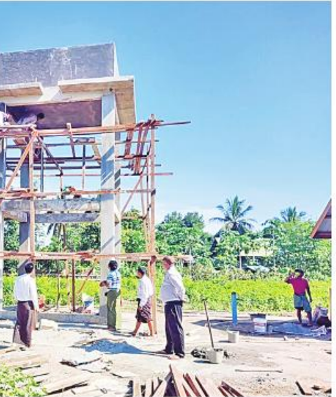
ဆက်စပ်လုပ်ငန်းများ ရာနှုန်းပြည့် နှင့် ကျွဲ၊ နွားတိရစ္ဆာန်များအတွက် ရာသီ ဆောင်ရွက်ပြီးစီးပါက ပွေးတူးကျေးရွာရှိ မရွေး သောက်သုံးရေဖူလုံစွာရရှိမည်ဖြစ် အိမ်ခြေ ၁၀၅ အိမ်၊ လူဦးရေ ၅၁၄ ဦး ကြောင်း သိရသည်။ ကိုဖြန့်

ပေ ၄၀၀ ခန့်ရှိ စက်ရေတွင်းတူးဖော် ခြင်း၊ အလျား ၁၀ ပေ၊ အနံ ရှစ်ပေ၊ အမြင့် ရှစ်ပေရှိ ရေစက်ရုံတည်ဆောက်ခြင်း၊ ဂါလန် ၂၄၀၀ ဆံ့ စင်မြင့်ရေစင်တည် ဆောက်ခြင်းနှင့် ဆက်စပ်လုပ်ငန်းများကို ၂၀၂၃-၂၀၂၄ ဘဏ္ဍာနှစ် ပြည်ထောင်စု ခွင့်ပြုချိန်ပုံငွေကျပ် ၂၈ ဒသမ ၁ သန်းဖြင့် တင်ဒါအောင်မြင်သည့် ပြည်သူ့ချမ်းသာ ကုမ္ပဏီက ယခုနှစ် ဇူလိုင်လ ဒုတိယပတ် က စတင်ဆောင်ရွက်ခဲ့ရာ ယခုအခါ လုပ်ငန်းများ ၇၀ ရာခိုင်နှုန်းဆောင်ရွက် ပြီးစီးပြီဖြစ်ကြောင်း သိရသည်။ အဆိုပါ စက်ရေတွင်းတူးဖော်ခြင်းနှင့်