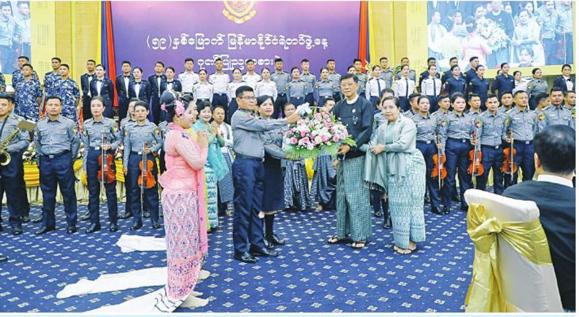
နိုင်ငံတော်စီမံအုပ်ချုပ်ရေးကောင်စီအဖွဲ့ဝင် ဒုတိယဝန်ကြီးချုပ်နှင့် ပို့ဆောင်ရေးနှင့်ဆက်သွယ်ရေးဝန်ကြီးဌာန ပြည်ထောင်စုဝန်ကြီး ဗိုလ်ချုပ်ကြီးမြထွန်းဦးနှင့် ဓနိုးတို့က သီဆိုဖျော်ဖြေခဲ့ကြသည့် မြန်မာနိုင်ငံရဲတပ်ဖွဲ့ ရဲတီးဝိုင်းနှင့်ဖျော်ဖြေရေးဌာနခွဲတို့ကို ဂုဏ်ပြုပန်းခြင်းပေးအပ်စဉ်။

များ၊ သံရုံးသံတမန်များ၊ အပြည်ပြည်ဆိုင်ရာ အဖွဲ့အစည်းများမှ ဖိတ်ကြားထားသော ဧည့်သည်တော်များ၊ ဌာနဆိုင်ရာအကြီးအကဲများ၊ အမျိုးသမီးရေးရာနှင့်ဆက်စပ်အဖွဲ့အစည်းများ၊ မြန်မာနိုင်ငံရဲတပ်ဖွဲ့ ရဲချုပ်နှင့်ရဲတပ်ဖွဲ့ဝင်များ၊ အငြိမ်းစားရဲအရာရှိကြီးများ၊ တာဝန်ရှိသူများနှင့်အတူ ဂုဏ်ပြုညစာကို အတူတကွသုံးဆောင်ကြသည်။