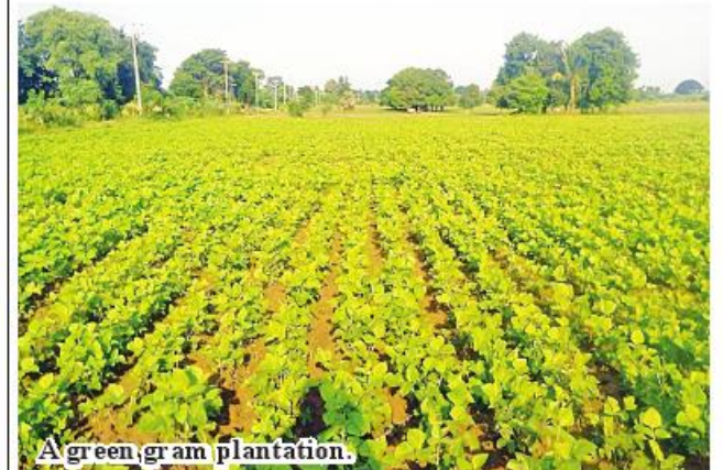
A green gram plantation.