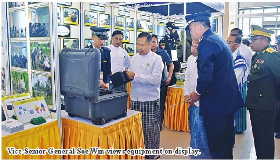
Vice-Senior General Soe Win views equipment on display.