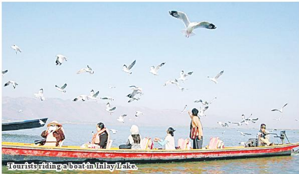
Tourists riding a boat in Inlay Lake.