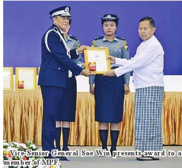
Vice-Senior General Soe Win presents award to a member of MPF.

ger of narcotic drugs. During the period from 2013 to 2022, Myanmar conducted special operations against narcotic drugs 38 times and is conducting the Operation 39 to prevent illegal import of prohibited precursor chemicals. From 1 January to 31 August 2023, Myanmar arrested 5,974 suspects in 4,380 cases with narcotic drugs and related accessories used in refining drugs worth More than K623 billion.