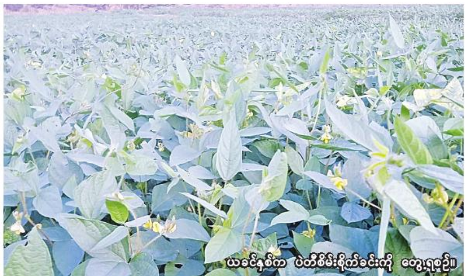
ယခင်နှစ်က ပဲတီစိမ်းစိုက်ခင်းကို တွေ့ရစဉ်။

မင်းကင်း အောက်တိုဘာ ၁ စစ်ကိုင်းတိုင်းဒေသကြီး ကလေးခရိုင် မင်းကင်းမြို့နယ်တွင် ယခုနှစ် မိုးသီးနှံစိုက်ပျိုးရာသီ၌ ပဲမျိုးစုံသီးနှံ ၈၄၈၅ ဧက စိုက်ပျိုးပြီးစီးနေပြီဖြစ်ကြောင်း မင်းကင်းမြို့နယ် စိုက်ပျိုးရေးဦးစီးဌာနမှ သိရသည်။ ယခုနှစ် မိုးသီးနှံစိုက်ပျိုးရာသီ၌ မင်းကင်းမြို့နယ်တွင် ပဲမျိုးစုံသီးနှံ ၈၄၈၅ ဧက စိုက်ပျိုးရန် လျာထားပြီး