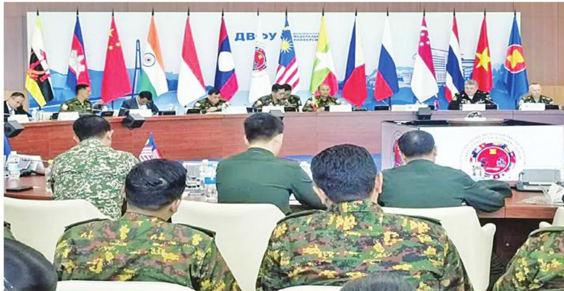
မြန်မာ-ရုရှား နှစ်နိုင်ငံ တပ်မတော်မှ ကိုယ်စားလှယ်များက မြန်မာနိုင်ငံ၌ပြုလုပ်ခဲ့သည့် စားပွဲတင်လေ့ကျင့်ခန်း (Table Top Exercise) တွင် ရေးဆွဲခဲ့သည့် စစ်ဆင်မှုစီမံချက်ကို အသေးစိတ်ပြန်လည်ညှိနှိုင်းဆွေးနွေးခဲ့ခြင်း

နေပြည်တော် အောက်တိုဘာ ၁ မြန်မာနိုင်ငံနှင့် ရုရှားနိုင်ငံတို့က ပူးတွဲ ပြုလုပ်ခဲ့သည့် အာဆီယံအပေါင်း အကြမ်းဖက်မှုတန်ပြန် တိုက်ဖျက်ရေးဆိုင်ရာ ကျွမ်းကျင်လုပ်ငန်း အဖွဲ့၏ အကြမ်းဖက်မှုတိုက်ဖျက်ရေးဆိုင်ရာ မြေပြင်လက်တွေ့လေ့ကျင့်ခန်း (Field Training Exercise) ကို စက်တင်ဘာ ၂၆ ရက်မှ ၂၉ ရက်ထိ ရုရှားနိုင်ငံ အရှေ့ပိုင်းဒေသ Primorsky Krai Vladivostok မြို့ရှိ အရှေ့ပိုင်းစစ်ခရိုင် Sergeevsky လေ့ကျင့်ရေးနယ်မြေတွင် ကျင်းပပြုလုပ်ခဲ့သည်။