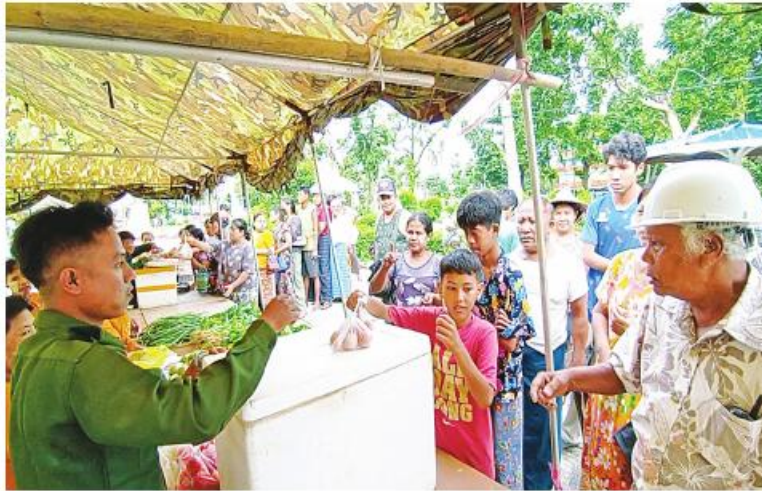
ရခိုင်ပြည်နယ် စစ်တွေမြို့ရှိ မုန်တိုင်းဒဏ်သင့်ပြည်သူများအား စားသောက်ကုန်ပစ္စည်းများနှင့် လူသုံးကုန်ပစ္စည်းများကို ဈေးနှုန်းသက်သာစွာဖြင့် ရောင်းချပေးစဉ်။

နေပြည်တော် အောက်တိုဘာ ၁ ဆိုင်ကလုနီးမုန်တိုင်း(မိုခါ) တိုက်ခတ်မှုကြောင့် မုန်တိုင်းဒဏ်သင့်ဒေသပြည်သူများနှင့် ဌာနဆိုင်ရာ ဝန်ထမ်းများ၏ စားသောက်ရေးအဆင်ပြေစေရန်နှင့် စားသောက်ကုန်ပစ္စည်းများကို ဈေးနှုန်းသက်သာစွာဖြင့် ဝယ်ယူစားသောက်နိုင်ရေးအတွက် အနောက်ပိုင်း တိုင်းစစ်ဌာနချုပ် နယ်မြေခံတပ်မတော်သားများနှင့် တာဝန်ရှိသူများက နေ့စဉ်ရောင်းချပေးလျက် ရှိသည်။