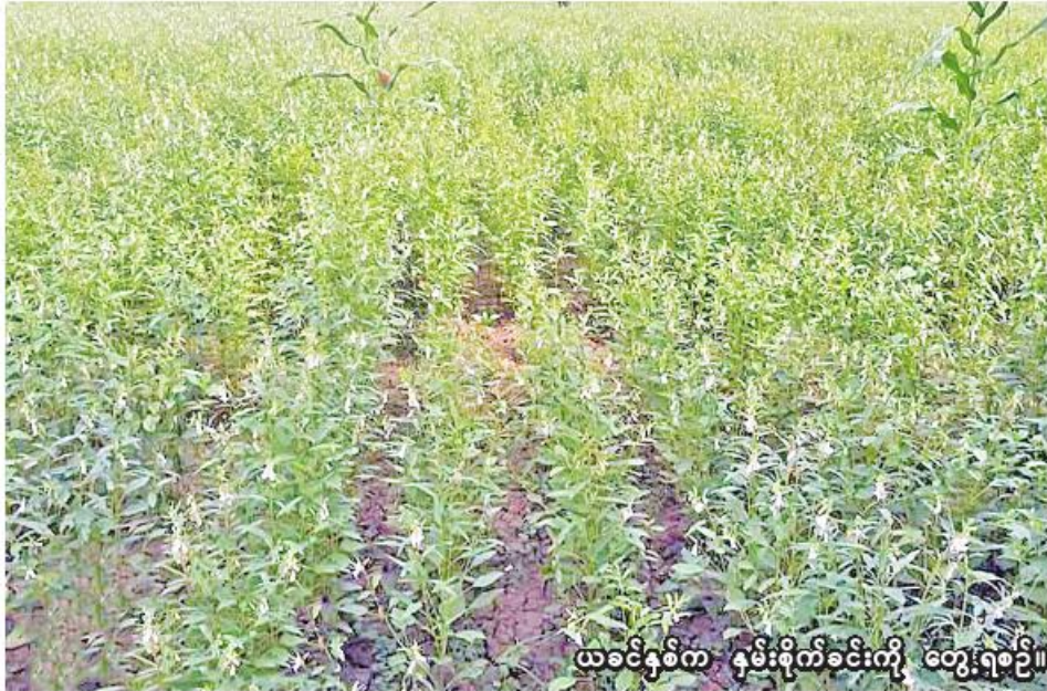
ယခင်နှစ်က နှမ်းစိုက်ခင်းကို တွေ့ရစဉ်။