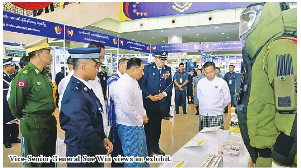
Vice-Senior General Soe Win views an exhibit.

From page 12 four members of MPF displayed on the anniversary and orders to four MPF mem- Then, the Vice-Senior General had a documentary photo taken with the attendees and viewed the exhibits