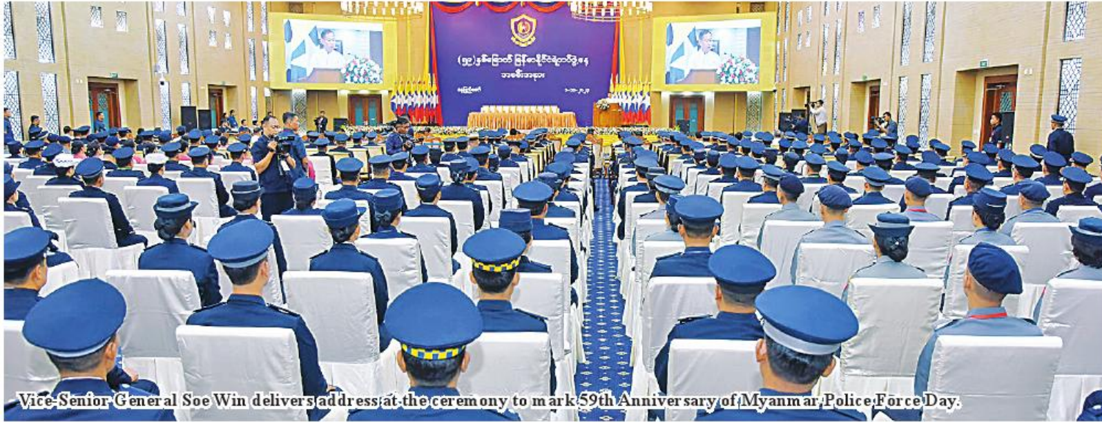
Vice-Senior General Soe Win delivers address at the ceremony to mark 59 th Anniversary of Myanmar Police Force Day.