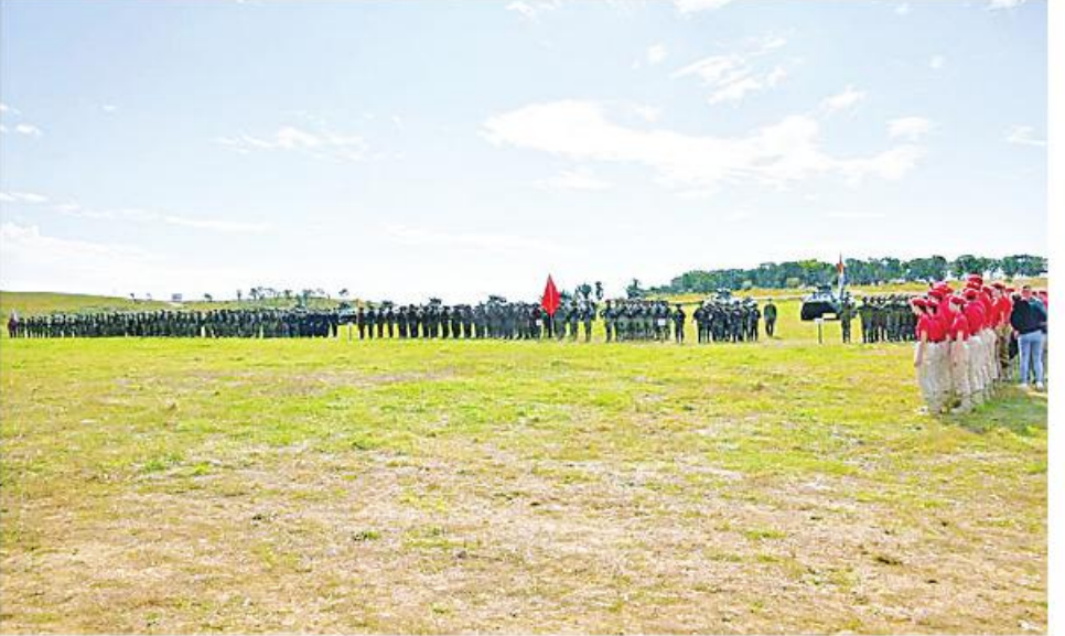
ညှိနှိုင်းကွပ်ကဲရေးမှူး(ကြည်း၊ ရေ၊ လေ) ဝိုလ်ချုပ်ကြီးမောင်မောင်အေး အာဆီယံအပေါင်းအကြမ်းဖက်မှုတန်ပြန်တိုက်ဖျက်ရေးဆိုင်ရာကျွမ်းကျင်လုပ်ငန်းအဖွဲ့၏ မြေပြင်လက်တွေ့ လေ့ကျင့်ခန်း (Field Training Exercise) ပိတ်ပွဲအခမ်းအနားတွင် အမှာစကားပြောကြားစဉ်။