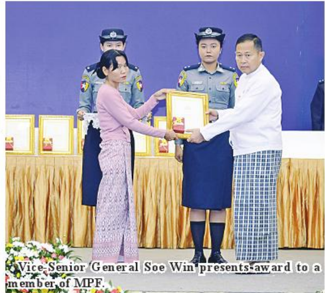
Vice-Senior General Soe Win presents award to a member of MPF.