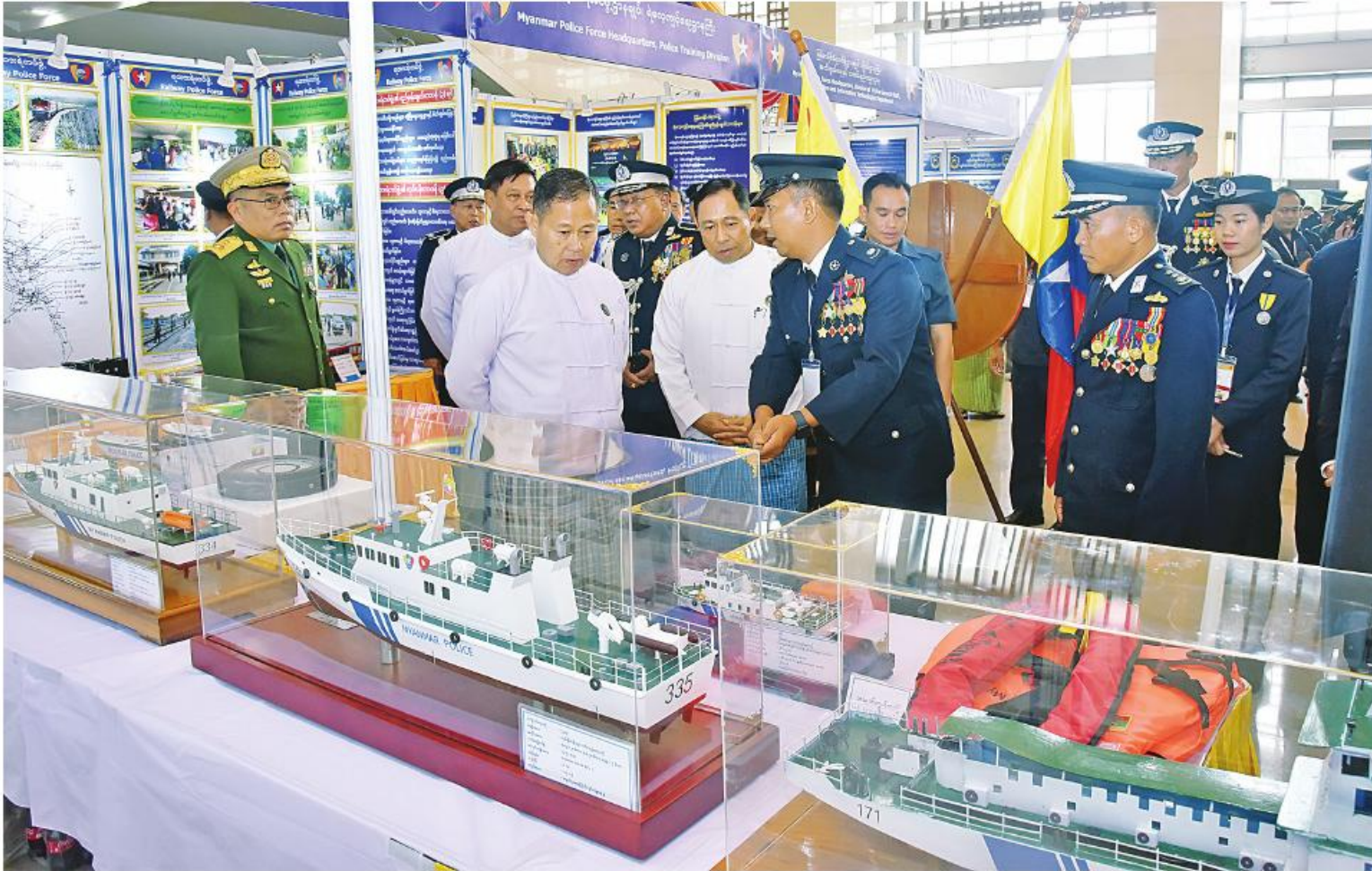
နိုင်ငံတော်စီမံအုပ်ချုပ်ရေးကောင်စီဒုတိယဥက္ကဋ္ဌ ဒုတိယဝန်ကြီးချုပ် ဒုတိယဗိုလ်ချုပ်မှူးကြီးစိုးဝင်း (၅၉)နှစ်မြောက် မြန်မာနိုင်ငံရဲတပ်ဖွဲ့နေ့အခမ်းအနားသို့ တက်ရောက်ခြင်းဖြစ်သည်။

နေပြည်တော် အောက်တိုဘာ ၁ (၅၉)နှစ်မြောက် မြန်မာနိုင်ငံရဲတပ်ဖွဲ့နေ့အခမ်းအနားကို ယနေ့နံနက် ၉ နာရီတွင် နေပြည်တော်ရှိ မြန်မာအပြည်ပြည်ဆိုင်ရာ ကွန်ဗင်းရှင်းဗဟိုဌာန-၂ (MICC-2)၌ကျင်းပရာ နိုင်ငံတော်စီမံအုပ်ချုပ်ရေးကောင်စီ ဒုတိယဥက္ကဋ္ဌ ဒုတိယဝန်ကြီးချုပ် ဒုတိယဗိုလ်ချုပ်မှူးကြီးစိုးဝင်း တက်ရောက်မိန့်ခွန်းပြောကြားသည်။ အခမ်းအနားသို့ နိုင်ငံတော်စီမံအုပ်ချုပ်ရေး ကောင်စီဝင်များ၊ ပြည်ထောင်စုဝန်ကြီးများ၊ ပြည်ထောင်စုအဆင့်ပုဂ္ဂိုလ်များ၊ တပ်မတော်အရာရှိကြီးများ၊ ဒုတိယဝန်ကြီးများ၊ သံတမန်များ၊ အပြည်ပြည်ဆိုင်ရာအဖွဲ့အစည်းများမှ ဖိတ်ကြားထားသော ဧည့်သည်တော်များ၊ ဌာနဆိုင်ရာအကြီးအကဲများ၊ အမျိုးသမီးရေးရာနှင့် ဆက်စပ်အဖွဲ့အစည်းများ၊ မြန်မာနိုင်ငံရဲတပ်ဖွဲ့ ရဲချုပ်နှင့်ရဲတပ်ဖွဲ့ဝင်များ၊ အငြိမ်းစားရဲအရာရှိကြီးများနှင့် တာဝန်ရှိသူများတက်ရောက်ကြသည်။ ဦးစွာအခမ်းအနားသို့ တက်ရောက်လာကြသူများက စာမျက်နှာ ၁၆ ကော်လံ ၁ P1