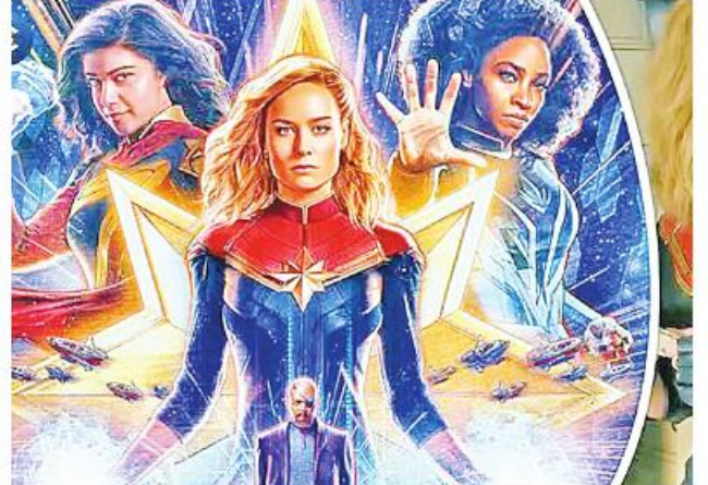
Ref: Screen Rant Trs: KKO

နယူးယောက် အောက်တိုဘာ ၁ ယခင်က မာဗယ်စူပါဟီးရိုး မာဗယ်စတူဒီယို၏ The Marvels ဇာတ်ကားသည် မာဗယ်စူပါဟီးရိုး ဇာတ်ကားများအနက် ပြသချိန် အတိုဆုံး စူပါဟီးရိုးဇာတ်ကားဖြစ်လာ မည်ဖြစ်ကြောင်း စက်တင်ဘာ ၃၀ ရက် သတင်းများအရ သိရသည်။ The Marvels ဇာတ်ကား၏ ပြသချိန်စုစုပေါင်းသည် ၁ နာရီ နှင့် ၄၅ မိနစ် (၁၀၅ မိနစ်)သာ ကြာမြင့်ကြောင်း မာဗယ်စတူဒီယို တာဝန်ရှိသူများက ပြောကြားသည်။ သို့ဖြစ်ရာ The Marvels ဇာတ်ကားသည် မာဗယ်စတူဒီယိုမှ ရိုက်ကူးပေါင်း ၂၂ ကားအနက် ပြသချိန် အတိုဆုံးဇာတ်ကားဖြစ် လာခဲ့သည်။ ယခင်က မာဗယ်စတူဒီယိုမှ ရိုက်ကူးထုတ်လုပ်သည့် The Incredible Hulk နှင့် Thor ဇာတ်ကားဖြစ်ပြီး ပြသချိန် ၁၁၂ မိနစ်စီ အသီးသီးရှိသည်။ The Marvels ဇာတ်ကားကို ဒါရိုက်တာ နီယာဒါကိုစတာက တာဝန်ယူ ရိုက်ကူးပေးထားပြီး မင်းသား ပတ်ဆီဂျွန်၊ မင်းသမီး ဘရီလာဆင်တို့ ပါဝင်သရုပ် ဆောင်ထားပြီး အဆိုပါဇာတ်ကား ကို ယခုနှစ် နိုဝင်ဘာ ၁၀ ရက်တွင် ရုံတင်ပြသရန် မာဗယ်စတူဒီယိုက စီစဉ်ထားကြောင်း သိရသည်။