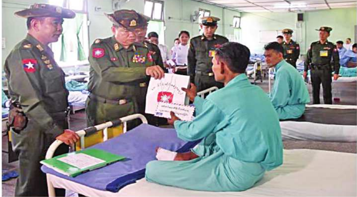
ကာကွယ်ရေးဦးစီးချုပ်ရုံး(ကြည်း)မှ ဒုတိယဗိုလ်ချုပ်ကြီးဖုန်းမြတ်နှင့် တောင်ပိုင်းတိုင်းစစ်ဌာနချုပ် တိုင်းမှူး ဝိုလ်မှူးချုပ်ကြည်သိုက်တို့ ဆေးကုသမှုခံယူနေသူများကို ရင်းရင်းနှီးနှီးမေးမြန်းအားပေးစကားပြောကြားပြီး စားသောက်ဖွယ်ရာများ ပေးအပ်စဉ်။

နေပြည်တော် စက်တင်ဘာ ၂၂ ပဲခူးတိုင်းဒေသကြီး တောင်ငူမြို့ရှိ တပ်မတော်ဆေးရုံ၌ တက်ရောက်ဆေးကုသမှုခံယူလျက်ရှိသော အရာရှိ၊ စစ်သည်၊ မိသားစုများနှင့် ဒေသခံပြည်သူများကို ယနေ့ မွန်းလွဲပိုင်းတွင် ကာကွယ်ရေးဦးစီးချုပ်ရုံး(ကြည်း)မှ ဒုတိယဗိုလ်ချုပ်ကြီးဖုန်းမြတ်၊ တောင်ပိုင်းတိုင်းစစ်ဌာနချုပ် တိုင်းမှူး ဝိုလ်မှူးချုပ်ကြည်သိုက်နှင့် အဖွဲ့ဝင်များက