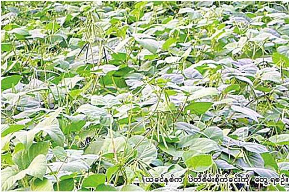
ယခင်နှစ်က ပဲတီစိမ်းစိုက်ခင်းကို တွေ့ရစဉ်။