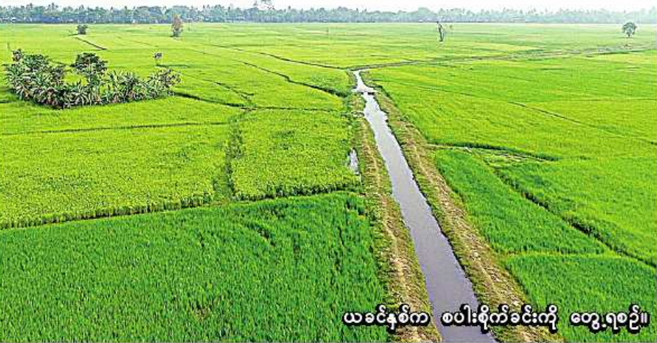
ယခင်နှစ်က စပါးစိုက်ခင်းကို တွေ့ရစဉ်။