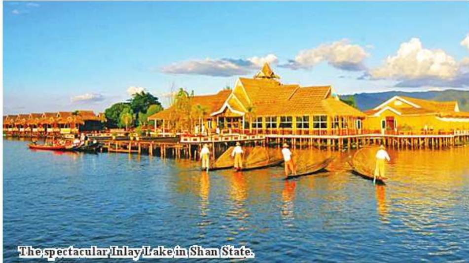
The spectacular Inlay Lake in Shan State.