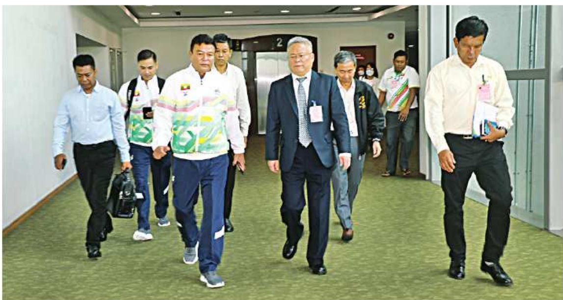
(Dota-2) အသင်း၊ စက်တင်ဘာ ၂၉ ရက် လှေလှော် ဖြစ်ကြောင်း သတင်းရရှိသည်။ အောက်တိုဘာ ၂ ရက်တွင် လှေလှော် အသင်းတို့ ဆက်လက်ထွက်ခွာမည် (သတင်းစဉ်)