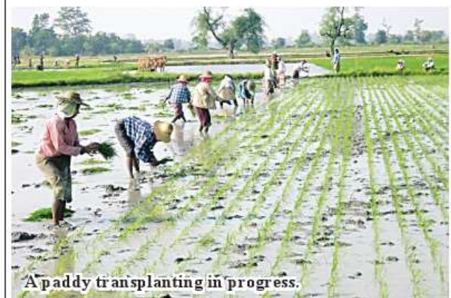
A paddy transplanting in progress.

For ensuring high yields and good crops, good strains and modern cultivation methods are being provided, according to the agriculture department Po Htet (Minbu)