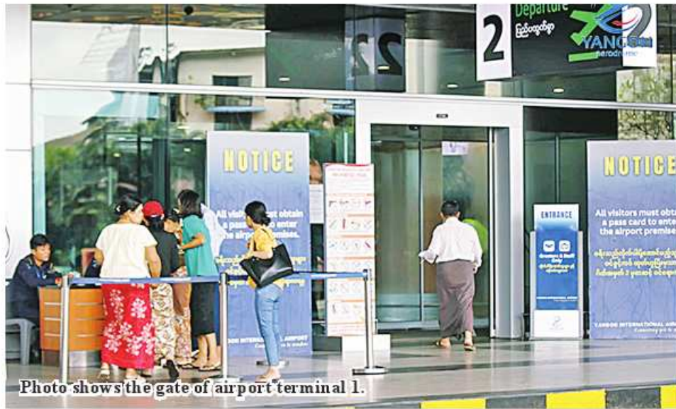
Photo shows the gate of airport terminal 1.

Yangon September 22 Those who want to see off or meet air passengers at the Yangon International Airport have been allowed to enter the building terminal 1, according to sources