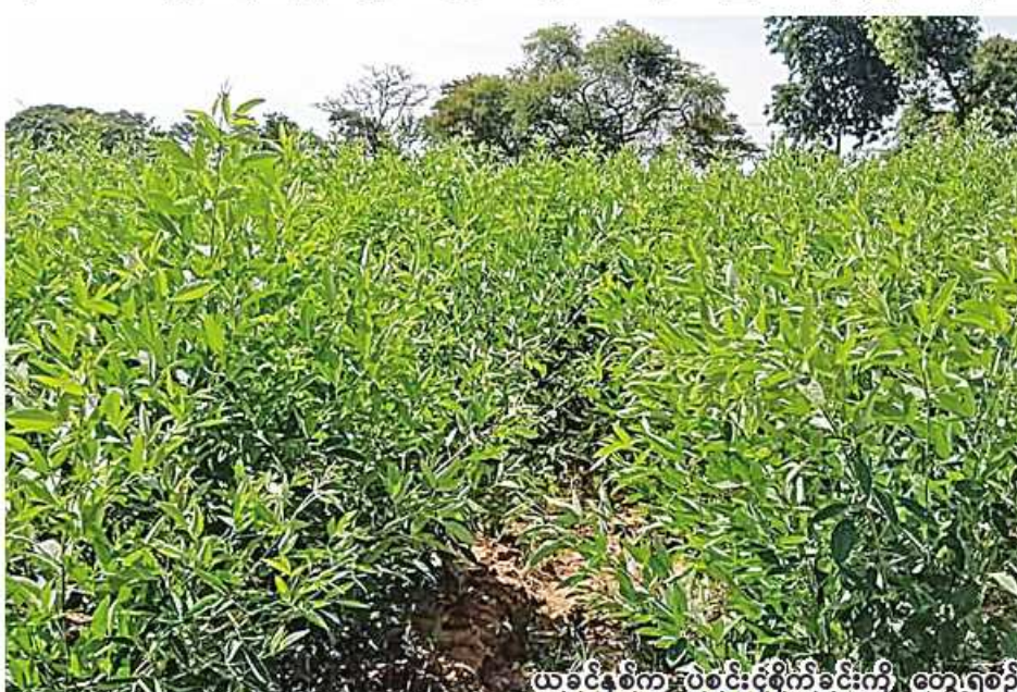
ယခုနှစ်က ပဲစင်းငုံစိုက်ခင်းကို တွေ့ရစဉ်။

ကသာခရိုင်နှင့်ကောလင်းခရိုင် တို့တွင် ယခုနှစ် ပဲစင်းငုံစိုက်ပျိုးပြီးစီးမှုအနေဖြင့် ကသာခရိုင် ကသာမြို့နယ်တွင် ၉၆၁ ဧက၊ ထီးချိုင့်မြို့နယ်တွင် ၂၅ ဧက၊ ကောလင်းခရိုင် ကောလင်းမြို့နယ်တွင် ၃၄၀ ဧက စိုက်ပျိုးကြပါတယ်”ဟု စစ်ကိုင်းတိုင်းဒေသကြီး စိုက်ပျိုးရေးဦးစီးဌာန ဒုတိယတိုင်းဒေသကြီးဦးစီးမှူး ဦးအောင်ကြည်ဝင်းက ပြောပြသည်။ ကသာခရိုင်နှင့်ကောလင်းခရိုင် တို့တွင် ယခုနှစ် ပဲစင်းငုံစိုက်ပျိုးပြီးစီးမှုအနေဖြင့် ကသာခရိုင် ကသာမြို့နယ်တွင် ၉၆၁ ဧက၊ ထီးချိုင့်မြို့နယ်တွင် ၂၅ ဧက၊ ကောလင်းခရိုင် ကောလင်းမြို့နယ်တွင် ၃၄၀ ဧက စိုက်ပျိုးကြပါတယ်”ဟု စစ်ကိုင်းတိုင်းဒေသကြီး စိုက်ပျိုးရေးဦးစီးဌာန ဒုတိယတိုင်းဒေသကြီးဦးစီးမှူး ဦးအောင်ကြည်ဝင်းက ပြောပြသည်။ ကသာခရိုင်နှင့်ကောလင်းခရိုင် တို့တွင် ယခုနှစ် ပဲစင်းငုံစိုက်ပျိုးပြီးစီးမှုအနေဖြင့် ကသာခရိုင် ကသာမြို့နယ်တွင် ၉၆၁ ဧက၊ ထီးချိုင့်မြို့နယ်တွင် ၂၅ ဧက၊ ကောလင်းခရိုင် ကောလင်းမြို့နယ်တွင် ၃၄၀ ဧက စိုက်ပျိုးကြပါတယ်”ဟု စစ်ကိုင်းတိုင်းဒေသကြီး စိုက်ပျိုးရေးဦးစီးဌာန ဒုတိယတိုင်းဒေသကြီးဦးစီးမှူး ဦးအောင်ကြည်ဝင်းက ပြောပြသည်။