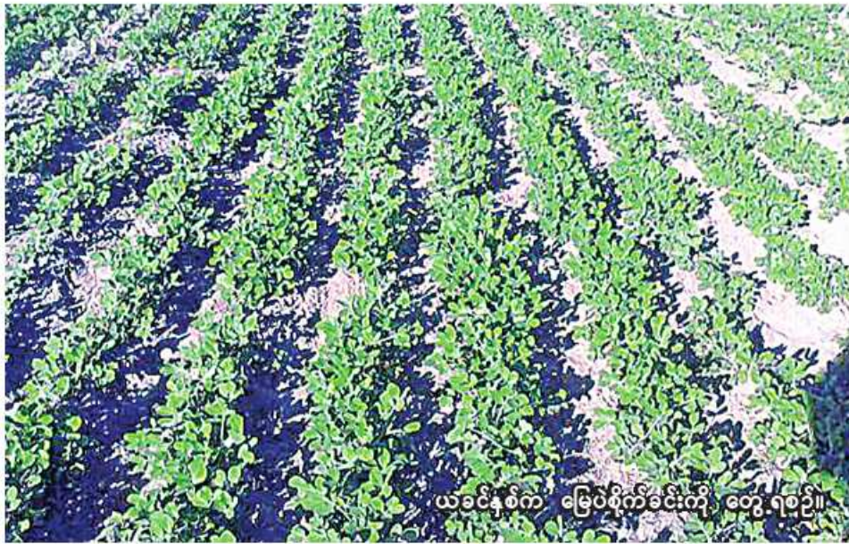
ယခင်နှစ်က မြေပဲစိုက်ခင်းကို တွေ့ရစဉ်။