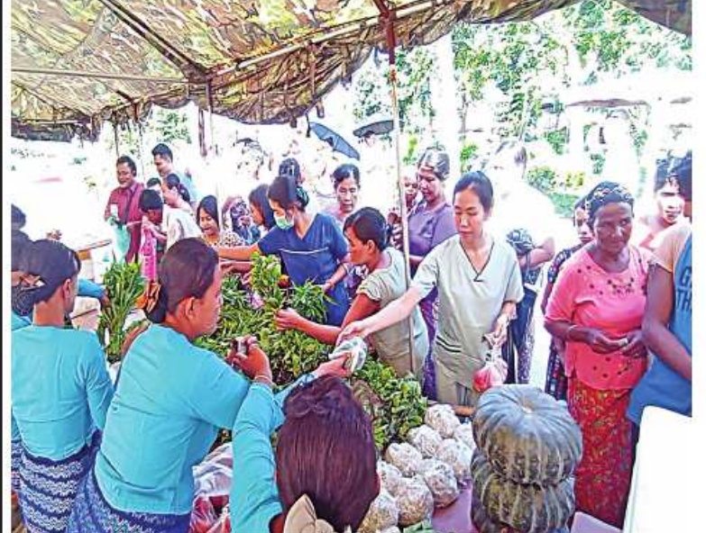
စစ်တွေမြို့ရှိ မုန်တိုင်းဒဏ်သင့်ပြည်သူများအား စားသောက်ကုန်ပစ္စည်းများနှင့် လူသုံးကုန်ပစ္စည်းများကို ဈေးနှုန်းသက်သာစွာဖြင့် ရောင်းချပေးစဉ်။

နေပြည်တော် စက်တင်ဘာ ၂၂ နှင့် စည်သူတံတားမြစ်သည် အမဲသား ဆိုင်ကလုန်းမုန်တိုင်း(မိခါ) တိုက်ခတ်မှုကြောင့် မုန်တိုင်းဒဏ်သင့် ဒေသခံပြည်သူများနှင့် ဌာနဆိုင်ရာဝန်ထမ်းများ၏ စားသောက်ရေးအဆင်ပြေစေရန်နှင့် မိမိတို့ အလိုရှိရာ စားသောက်ကုန်ပစ္စည်းများကို ဈေးနှုန်းသက်သာစွာဖြင့် ဝယ်ယူစားသောက်နိုင်ရေးအတွက် အနောက်ပိုင်းတိုင်း စစ်ဌာနချုပ် နယ်မြေခံတပ်မတော်သားများနှင့် တာဝန်ရှိသူများက နေ့စဉ်ရောင်းချပေးလျက်ရှိသည်။ ယနေ့တွင်လည်း စစ်တွေမြို့ ဦးဥတ္တမပန်းခြံ၌ အခြေခံစားသောက်ကုန်များဖြစ်သည့် ဆန်၊ ဆီ၊ ဆား၊ အသား၊ ငါး၊ ကြက်ဥ၊ ဘဲဥ၊ နို့ထွက်ပစ္စည်းများ၊ ဟင်းသီးဟင်းရွက်များ၊ ကြက်သွန်နီ၊ ကြက်သွန်ဖြူများကို လည်းကောင်း၊ တပ်မတော်စက်ရုံများနှင့် မြန်မာစီးပွားရေး ကော်ပိုရေးရှင်းတို့မှ ထုတ်လုပ်သည့် ခေါက်ဆွဲခြောက်၊ ဘီစကွတ်ခွံကြောင်း သတင်းရရှိသည်။ စစ်တွေမြို့ရှိ မုန်တိုင်းဒဏ်သင့်ပြည်သူများအား စားသောက်ကုန်ပစ္စည်းများနှင့် လူသုံးကုန်ပစ္စည်းများကို ဈေးနှုန်းသက်သာစွာဖြင့် ရောင်းချပေးစဉ်။