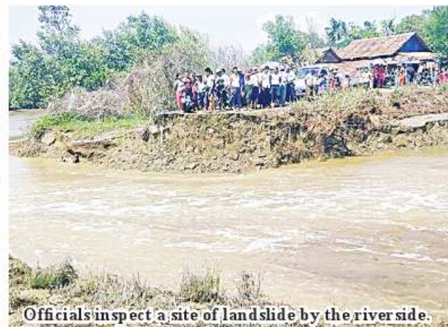
Officials inspect a site of landslide by the river side.

ment the landslide prevention works, business equipment will be purchased from pri-