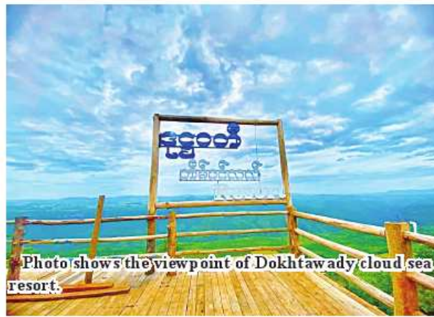
Photo shows the viewpoint of Dokhtawady cloud sea resort.

Currently, Nawngkhio Township has five cloud