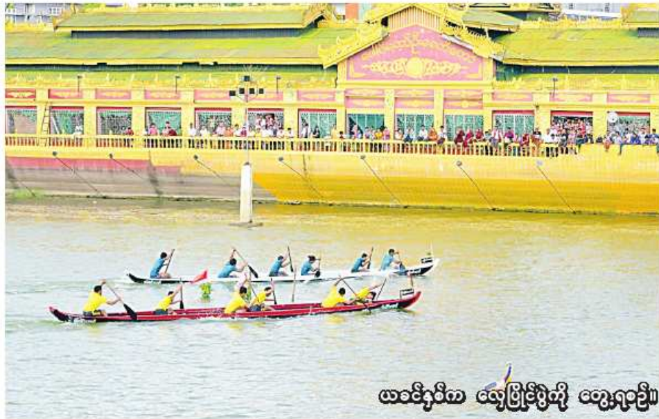
ယခင်နှစ်က လှေပြိုင်ပွဲကို တွေးရစဉ်။

မိတ္ထီလာ စက်တင်ဘာ ၂၂ မန္တလေးတိုင်းဒေသကြီး မိတ္ထီလာ မြို့ရှိ သမိုင်းဝင်ကရဝိက်ဖောင်တော် ဦးဘုရားပွဲတော်၌ ထည့်သွင်း ကျင်းပမည့် ရိုးရာလှေသဘင်ပွဲတော် တွင် ပြိုင်ပွဲဝင်အသင်းပေါင်း ၂၆ သင်း ပါဝင်ယှဉ်ပြိုင်မည်ဖြစ်ကြောင်း