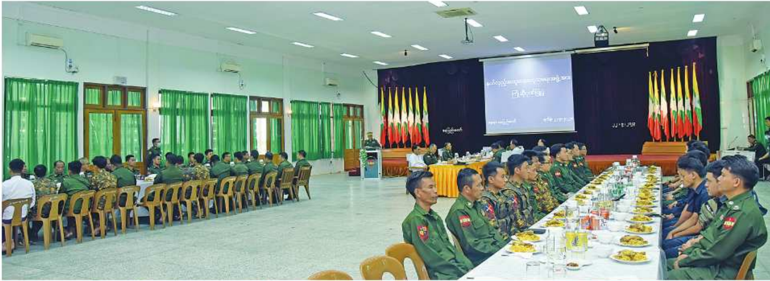
ကာကွယ်ရေးဦးစီးချုပ်ရုံး(ကြည်း)မှ တွဲဖက်စစ်ရေးချုပ် ဗိုလ်ချုပ်ထိန်လင်း နယ်လှည့်အထူးဆေးကုသရေးအဖွဲ့ကို ဂုဏ်ပြုအမှာစကားပြောကြားစဉ်။

နေပြည်တော် စက်တင်ဘာ ၂၂ - စစ်ကိုင်းတိုင်းဒေသကြီး ရွှေဘိုမြို့ပေါ် နှင့် အနီးပတ်ဝန်းကျင်မှ ကျေးလက်နေ ဒေသခံပြည်သူများကို ကျန်းမာရေးစောင့် ရှောက်မှုလုပ်ငန်းများ ဆောင်ရွက်ပေးရန် သွားရောက်ခဲ့သည့် တပ်မတော်နှင့်ကျန်းမာ ရေးဝန်ကြီးဌာနမှ ပါရဂူများ၊ ဆေးမှူးများ နှင့် သူနာပြုများပါဝင်သော အထူးဆေး ကုသရေးအဖွဲ့သည် ယနေ့ နံနက်ပိုင်းတွင် နေပြည်တော်သို့ ပြန်လည်ရောက်ရှိကြရာ ကာကွယ်ရေးဦးစီးချုပ်ရုံး(ကြည်း)မှ တွဲဖက် စစ်ရေးချုပ် ဗိုလ်ချုပ်ထိန်လင်း၊ ဆေး ဝန်ထမ်းညွှန်ကြားရေးမှူးချုပ် ညွှန်ကြားရေး မှူးတို့က ဂုဏ်ပြုအမှာစကားများ ပြော ကြားပြီး ဂုဏ်ပြုပတ်တော်ပေးအပ်ကာ နေ့လယ်စာဖြင့် တည်ခင်းဧည့်ခံသည်။