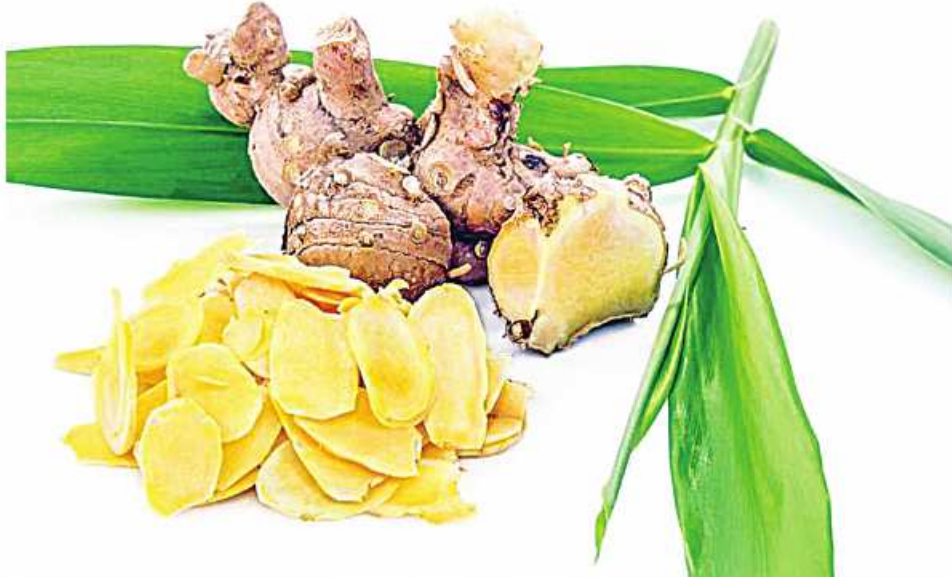
ဆေးဖက်ဝင် မိသလင်ကို တွေ့ရစဉ်။

ဖြေ ။ ။ တောရွက်မြစ်၊ ဝံအူမြစ်တွေသွေးလိမ်းပါ။ ဆေးလိမ်းပြီး လက်မောင်းဆုံကို ငြိမ်အောင် ပတ်တီးနဲ့စည်းပေးထားနိုင်ရင် ပိုကောင်းပါတယ်။ ပဲခူးကိုသိုင်းပြီးစည်းတဲ့နည်းနဲ့ စည်းရမှာဖြစ်ပါတယ်။ အေးတဲ့အချိန် ဒါမှမဟုတ် ညအိပ်ရာဝင်ချိန် လက်မောင်းဆုံကိုခဲရင် လွယ်ကူတဲ့ နည်းကတော့ ဗာဒ်ရွက် ဒါမှမဟုတ် ရဲယိုရွက်မီးကင်ပြီး နှမ်းဆီ ဒါမှမဟုတ် မုန့်ညင်းဆီသုတ်ပြီး လက်မောင်းဆုံမှာ ကပ်ပေးပါ။ အထူးသဖြင့် အေးတဲ့အချိန်မှာ ညအိပ်တဲ့အခါပြုတ်ဖူးတဲ့လက်မောင်းဆုံဘက်ကို ဖိမအိပ်တာ အကောင်းဆုံး ဖြစ်ပါတယ်။