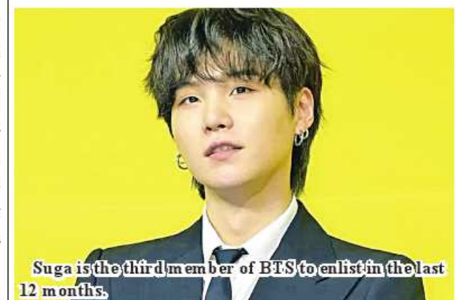
Suga is the third member of BTS to enlist in the last 12 months.