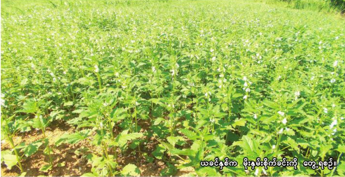
ယခင်နှစ်က မိုးနမ်းစိုက်ခင်းကို တွေ့ရစဉ်။

ငပုတော စက်တင်ဘာ ၂၀ ပျိုးရာသီ၌ မိုးသီးနှံစုံ ၅၇၄၉ ဧကစိုက်ပျိုး ပြောပြ၍ သိရသည်။ ငပုတောမြို့နယ်တွင် ယခုနှစ် မိုးသီးနှံ စိုက်ပျိုးရာသီ၌ မိုးသီးနှံစုံ ၅၇၄၉ ဧက