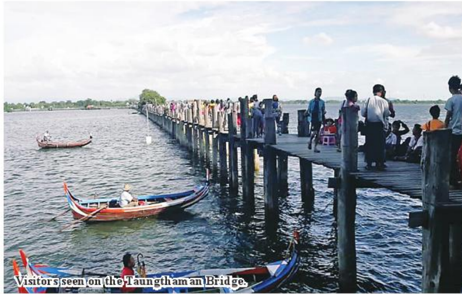
Visitors seen on the Taungthaman Bridge.

Mandalay September 20 The number of domestic and foreign tourists visiting Taungthaman Bridge and lake has increased, according to U Soe Win, secretary