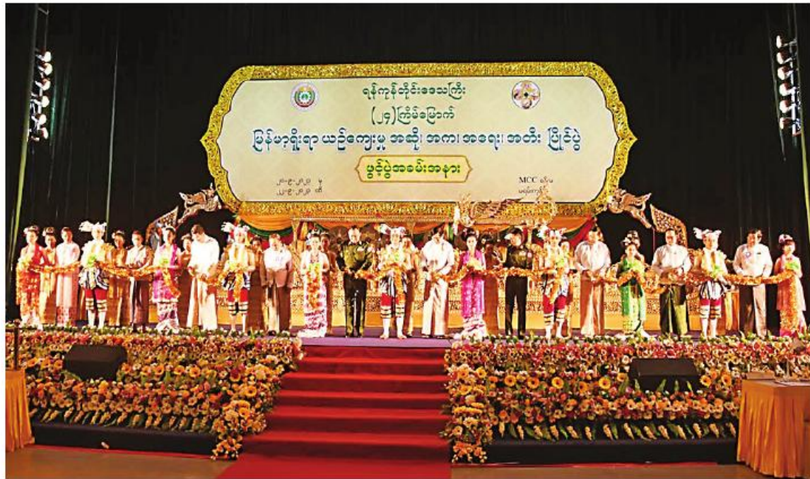
ရန်ကုန်တိုင်းဒေသကြီး ဝန်ကြီးချုပ် ဦးစိုးသိန်း၊ တိုင်းမှူး ဗိုလ်ချုပ်ဇော်ဟိန်းနှင့်တာဝန်ရှိသူများက (၂၄)ကြိမ်မြောက် မြန်မာ့ရိုးရာယဉ်ကျေးမှု အဆို၊ အက၊ အရေး၊ အတီးပြိုင်ပွဲကို ဖွင့်ပွဲကျင်းပပေးခဲ့ခြင်း