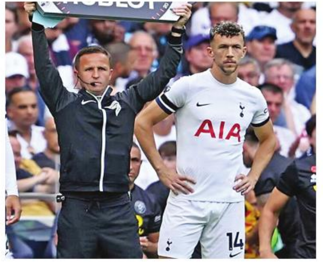
ခန့်ထိ အနားယူရမည်ရှိနေပြီး လာမည့် ၂၀၂၄ ခုနှစ် မတ်လကုန် ပိုင်းမှသာ ပြန်လည်ကြိုခိုင်မှုပြည့်ဝ ဖွယ်ရှိနေကြောင်း သိရသည်။ Ref : Football London Trs : STA

ဒဏ်ရာရရှိခဲ့သည့်အတွက် ကာလ ရှည်အနားယူရမည် အရေးနှင့် ကြုံတွေ့ခဲ့ရခြင်းဖြစ်သည်။ ပါရီဆစ်သည် လက်ရှိနည်းပြ ပိုစတီကိုဝလူ လက်အောက်တွင် လည်း အဓိက ကစားသမားအဖြစ် ပွဲထွက်ခွင့်ရရှိနေသူဖြစ်ပြီး ယခုနှစ် ဘောလုံးရာသီတွင်လည်း ငါးပွဲလုံး ပါဝင်ကစားခွင့် ရရှိထားကာ ဂိုးဖန်တီးမှုတစ်ကြိမ်ပြုလုပ်ထားသူ ဖြစ်သည်။ ပါရီဆစ်၏ဒဏ်ရာနှင့်ပတ်သက် ပြီး အသေးစိတ်စစ်ဆေးမှုများ ဆက်လက်ပြုလုပ်သွားရမည်ဖြစ်ပြီး ခွဲစိတ်မှု ခံယူရမည့်အခြေအနေ များကြောင့် အနည်းဆုံးခြောက်လ