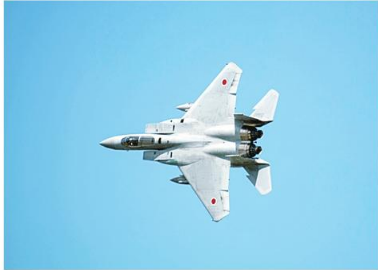
Boeing ကုမ္ပဏီသည် ဂျပန်နိုင်ငံ၏ F-15 Super Interceptor တိုက်လေယာဉ်များကို Electronic Warfare Suite ဖြင့် အဆင့်မြှင့်တင်မည်ဖြစ်ကြောင်း ဖော်ပြခဲ့သည်။

Boeing-BAE Systems တို့ ပူးတွဲ ထုတ်လုပ်ထားသော Eagle Passive Warning Survivability System (EPWSS) သတိပေးစနစ်သည် ပြိုင်ဆိုင်မှု ပြင်းထန်သောပတ်ဝန်းကျင်တွင် တိုက်လေယာဉ်၏ ရှင်သန်နိုင်စွမ်းကို မြှင့်တင်ပေးလိမ့်မည်ဖြစ်သည်။ BAE ကုမ္ပဏီ၏အဆိုအရ စနစ်၏ အဆင့်မြှင့်ရေးဒီဇိုင်းအား အီလက်ထရွန်နစ်တန်ပြန်လုပ်ဆောင်မှုများသည် လျင်မြန်စွာတုံ့ပြန်နိုင်စွမ်းရှိပြီး ခေတ်မီပေါင်းစပ်လေကြောင်းရန်ကာကွယ်ရေးစနစ်များကို ပိုမိုနက်ရှိုင်းစွာ ထိုးဖောက်ဝင်ရောက်နိုင်စေသည်။ ၎င်းသည် လေယာဉ်မျိုးအား ညွှန်းရပ် ၃၆၀ ဒီဂရီ စစ်မြေပြင်အခြေအနေများကို