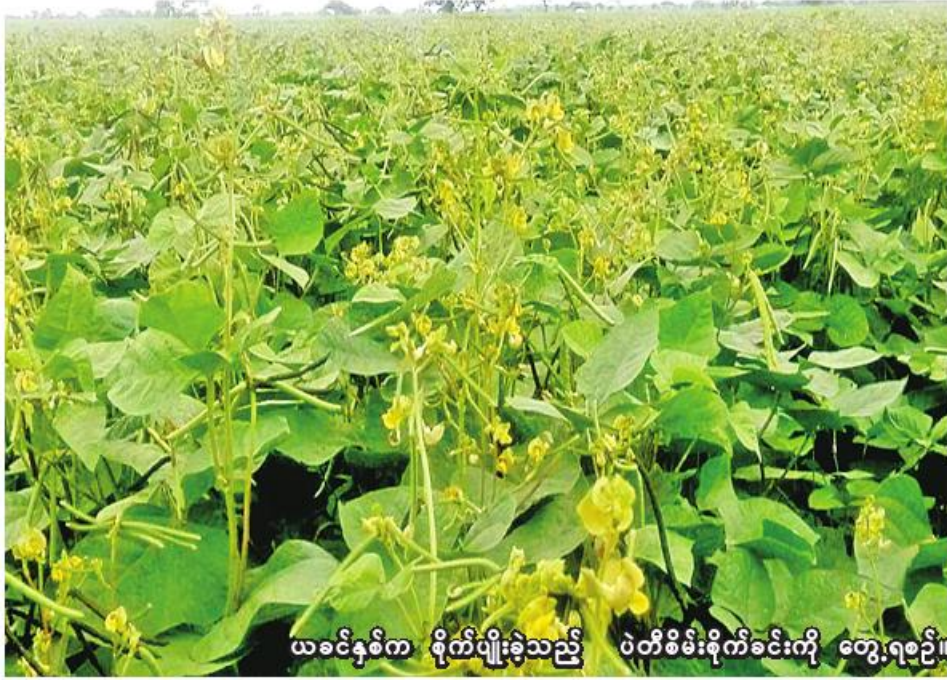
ယခင်နှစ်က စိုက်ပျိုးခဲ့သည့် ပဲတီစိမ်းစိုက်ခင်းကို တွေ့ရစဉ်။