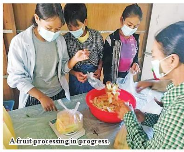
A fruit processing in progress.

the Mandalay Region Department. "We set an aim for production of value-added fruit products. So, local people can earn incomes from production of such snacks. The seven-day training will create job opportunities for local people. The training course will help local people produce snacks on a commercial scale. Our department will provide necessary aid to them. The course will be conducted under the protocols of the Covid-19 issued by the Ministry of Health,"