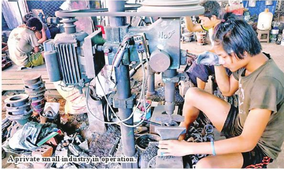
A private small industry in operation.

Nay Pyi Taw September 20 Myanmar and the Philippines will cooperate for the development of agriculture and micro, small and medium enterprises (MSME) sectors, according to reports from the Union of Myanmar Federation of Chambers of