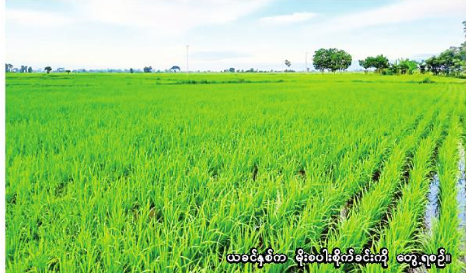
ယခင်နှစ်က မိုးစပါးစိုက်ခင်းကို တွေ့ရစဉ်။