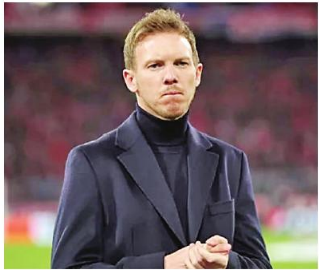
Ref : Bild Trs : ML

နာဂျယ်စမန်းသည် ဘိုင်ယန် မြူးနစ်အသင်းနှင့် သဘောတူစာချုပ်