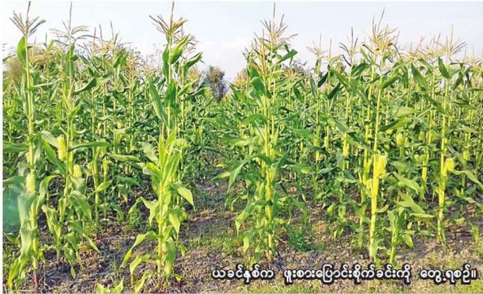
ယခင်နှစ်က ဖူးစားပြောင်းစိုက်ခင်းကို တွေ့ရစဉ်။

စစ်ကိုင်း ဧကတင်ဘာ ၂၀ စစ်ကိုင်းတိုင်းဒေသကြီး စစ်ကိုင်းခရိုင် မြင်းမူမြို့နယ်တွင် ယခုနှစ် မိုးသီးနှံစိုက်ပျိုးရာသီ၌ အစေ့ထုတ်ပြောင်းနှင့် ဖူးစားပြောင်း ၁၄၂၃ ဧက စိုက်ပျိုးပြီးစီးနေပြီဖြစ်ကြောင်း စစ်ကိုင်းခရိုင် စိုက်ပျိုးရေးဦးစီးဌာနမှ သိရသည်။ စစ်ကိုင်းတိုင်းဒေသကြီး စစ်ကိုင်းခရိုင် မြင်းမူမြို့နယ်တွင် ယခုနှစ် မိုးသီးနှံစိုက်ပျိုးရာသီ၌ အစေ့ထုတ်