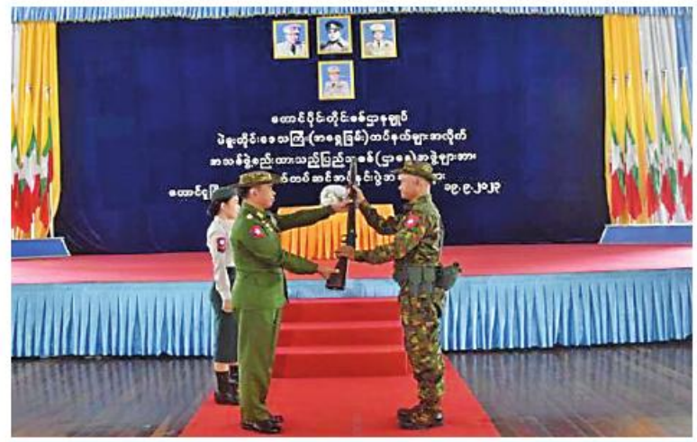
ကာကွယ်ရေးဦးစီးချုပ်ရုံး(ကြည်း)မှ ဒုတိယဗိုလ်ချုပ်ကြီးဖုန်းမြတ် ပြည်သူ့စစ် (ဌာနေ) တပ်ဖွဲ့ဝင်တစ်ဦးကို လက်နက်အပ်နှင်းပေးစဉ်။

နေပြည်တော် စက်တင်ဘာ ၂၀ (ကြည်း)မှ ဒုတိယဗိုလ်ချုပ်ကြီးဖုန်းမြတ်၊ ပဲခူးတိုင်းဒေသကြီး ဝန်ကြီးချုပ် ဦးမျိုးဆွေဝင်း၊ တောင်ပိုင်းတိုင်းစစ်ဌာနချုပ် တိုင်းမှူး ဗိုလ်ချုပ်ကြည်သိုက်၊ ကာကွယ်ရေးဦးစီး ချုပ်ရုံး(ကြည်း) ပြည်သူ့စစ်နှင့် နယ်ခြားတပ် များညွှန်ကြားရေးမှူး ဗိုလ်ချုပ်အောင်ပိုင်ဦးနှင့် တာဝန်ရှိသူများ၊ ပြည်သူ့စစ်(ဌာနေ)တပ်ဖွဲ့ ဝင်များတက်ရောက်ကြသည်။