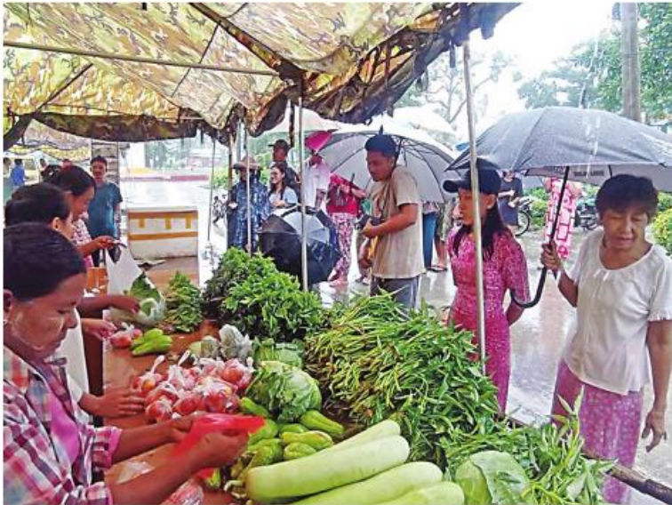
စစ်တွေမြို့ရှိ မုန်တိုင်းဒဏ်သင့်ပြည်သူများအား စားသောက်ကုန်ပစ္စည်းများနှင့် လူသုံးကုန်ပစ္စည်းများကို ဈေးနှုန်းသက်သာစွာဖြင့် ရောင်းချပေးစဉ်။

နေပြည်တော် စက်တင်ဘာ ၂၀ - နိုင်ငံရေးအတွက် အနောက်ပိုင်းတိုင်း ဆိုင်ကလုနီးမုန်တိုင်း(မိုခါ) တိုက်ခတ်မှု နှင့် ကြောင့် မုန်တိုင်းဒဏ်သင့် ဒေသခံပြည်သူ များနှင့် ဌာနဆိုင်ရာဝန်ထမ်းများ၏ စားသောက်ရေးအဆင်ပြေစေရန်နှင့် မိမိတို့ အလိုရှိရာ စားသောက်ကုန်ပစ္စည်းများကို ဈေးနှုန်းသက်သာစွာဖြင့် ဝယ်ယူစားသောက်