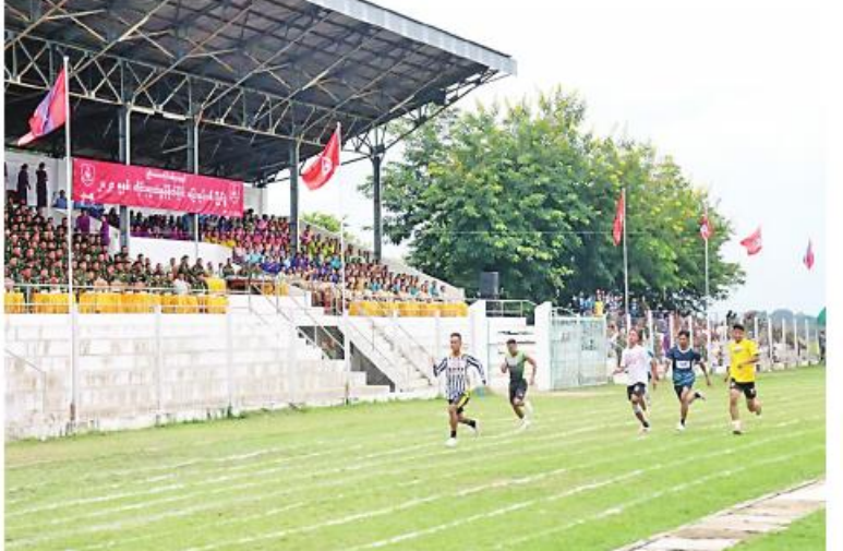
တြိဂံဒေသတိုင်းစစ်ဌာနချုပ် တိုင်းမှူးခိုင်း အမျိုးသား၊ အမျိုးသမီး ပြေးခုန်ပစ်ပြိုင်ပွဲ ဖွင့်ပွဲပြုလုပ်ပွဲ ယှဉ်ပြိုင်ကစားနေမှုကို တွေ့ရစဉ်။

နေပြည်တော် စက်တင်ဘာ ၂၀ - ဦးစွာ တိုင်းမှူးက အမှာစကားပြောကြား တြိဂံဒေသတိုင်းစစ်ဌာနချုပ် ၂၀၂၃ သည်။ ထို့နောက် တိုင်းမှူးနှင့် တက်ရောက် ခုနှစ် တိုင်းမှူးခိုင်း အမျိုးသား၊ အမျိုးသမီး လာကြသူများက ပြိုင်ပွဲဝင်အသင်းများ၏ ပြေးခုန်ပစ်ပြိုင်ပွဲ ဖွင့်ပွဲကို ယနေ့နံနက် ယှဉ်ပြိုင်ကစားနေမှုများကို ကြည့်ရှုအား ပိုင်းတွင် ကျိုင်းတုံမြို့ ခရိုင်အားကစားကွင်း၌ ပေးကြသည်။ ပြုလုပ်ရာ တိုင်းမှူး ဗိုလ်ချုပ်အောင်ခိုင်ဝင်း အဆိုပါ တိုင်းမှူးခိုင်း အမျိုးသား၊ နှင့်အဖွဲ့ဝင်များ၊ အရာရှိ၊ စစ်သည်၊ အမျိုးသမီး ပြေးခုန်ပစ်ပြိုင်ပွဲကို တိုင်းစစ် မိသားစုဝင်များ၊ ခိုင်အဖွဲ့ဝင်များ၊ ပြိုင်ပွဲဝင် ဌာနချုပ် ကွပ်ကဲမှုအောက် တပ်နယ်အသီး သီးမှ ပြိုင်ပွဲဝင်အသင်း ၁၂ သင်းဖြင့် ရှင်များနှင့် ဖိတ်ကြားထားသူများတက် စက်တင်ဘာ ၂၅ ရက်ထိ ယှဉ်ပြိုင်ကစား သွားမည်ဖြစ်ကြောင်း သတင်းရရှိသည်။