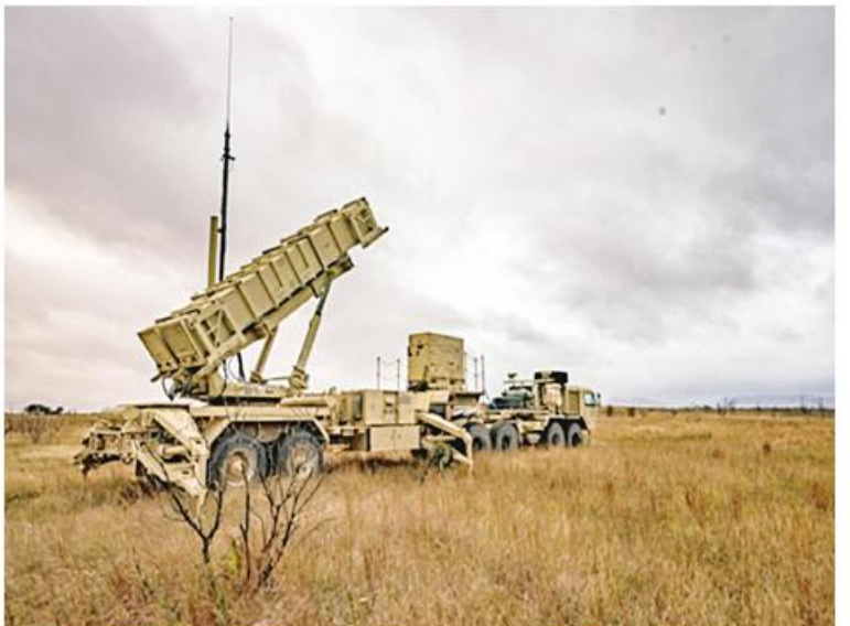
ကျွမ်းကျင်ပညာရှင်များ ပါဝင်သည့် ကြားဖြတ်ဟန့်တားရေးစနစ်များကို ဖြန့်ဖြူးပေးရန်အတွက် ကနေဒါနိုင်ငံက ကန်ဒေါ်လာ ၂၄ သန်းပံ့ပိုးမည်။ Canada to Allocate $24Mln for Supply of Air Defense Systems to Ukraine ကို ဘာသာပြန်ဆိုထားပါသည်။

ကို လေ့ကျင့်သင်တန်းပေးရန် Unifier ကိုတည်ထောင်ခဲ့သည်။ အဆိုပါကြိုးပမ်းမှုကို အကောင်အထည်ဖော်ရန် ကနေဒါစစ်သည် ၁၇၀ ခန့်သည် ဗြိတိန်တွင်ရှိနေသည်။ Unifier လက်အောက်ရှိ သင်တန်းများတွင် လက်နက်ကိုင်တွယ်ခြင်း၊ စစ်မြေပြင်ရှင်သန်နေထိုင်ခြင်း၊ ရှေးဦးသူနာပြုစုခြင်းနှင့် လက်နက်ကိုင်ပဋိပက္ခဆိုင်ရာဥပဒေများ သင်ကြားပေးခြင်းတို့ ပါဝင်သည်။ Kent မြို့ရှိ Lydd လေ့ကျင့်ရေးစခန်းသည် ဗြိတိန်နိုင်ငံ၏ ကိုယ်ပိုင်စီမံကိန်းဖြစ်သည့် Operation Interflex အတွက် အခြေစိုက်နေရာလည်းဖြစ်သည်။ Interflex စစ်ဆင်ရေးတွင် ယူကရိန်းတပ်ဖွဲ့ဝင် ၁၇၀၀၀ ကျော်ကို လေ့ကျင့်သင်ကြားပေးခဲ့သည်။ ဗြိတိန်စစ်သားများနှင့်အတူ သင်တန်းပို့ချသူများသည် လစ်သူယေးနီးယားနှင့် ဥရောပအဖွဲ့ဝင်နိုင်ငံများမှ