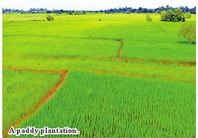
A paddy plantation.