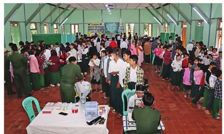
နယ်မြေခံဆေးကုသရေးအဖွဲ့က ပြင်ဦးလွင်မြို့ အမှတ်(၃)အခြေခံပညာအထက် တန်းကျောင်းရှိ ဆရာ၊ ဆရာမများနှင့် ကျောင်းသား၊ကျောင်းသူများကို ကျန်းမာရေး စောင့်ရှောက်မှုလုပ်ငန်းများ ဆောင်ရွက်ပေးစဉ်။

နယ်မြေခံဆေးကုသရေးအဖွဲ့က ဆရာ၊ ဆရာမများနှင့် ကျောင်းသား၊ ကျောင်းသူ ၃၅၇ ဦးတို့ကို ဖျားနာရောဂါ၊ ခွဲစိတ်ကုသမှု ဆိုင်ရာရောဂါ၊ အရိုးအကြောရောဂါ၊ ကလေးရောဂါ၊ မျက်စိရောဂါ၊ သွားနှင့်သံတွင်း ရောဂါ၊ သားဖွားမီးယပ်ရောဂါ၊ အထွေထွေ ရောဂါတို့နှင့် ပတ်သက်၍ လိုအပ်သည့် ကျန်းမာရေး စစ်ဆေးကုသပေးခြင်းများ ဆောင်ရွက်ပေးပြီး ECG စက်၊ Ultra-sound စက်တို့ဖြင့် ရောဂါရှာဖွေစစ်ဆေးပေး ခြင်းတို့ကို ဆောင်ရွက်ပေးကာ ဆေးရုံ တက်ရောက်ကုသရန် လိုအပ်သူများ အား နယ်မြေခံတပ်မတော်ဆေးရုံသို့ တက်ရောက်ကုသနိုင်ရေး စီစဉ်ဆောင်ရွက် ပေးသည်။ ယင်းသို့ ဆောင်ရွက်နေမှုများကို ပြင်ဦးလွင်တပ်နယ်မှ တာဝန်ရှိသူများက သွားရောက်ကြည့်ရှုအားပေးပြီး လိုအပ် သည်များ ပေါင်းစပ်ညှိနှိုင်းဆောင်ရွက်ပေး ခဲ့ကြောင်း သတင်းရရှိသည်။