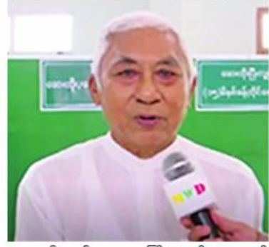
အတွက်လည်း အများကြီးအကျိုးကျေးဇူးရှိ ပါတယ်။ အဲလိုဖြစ်တဲ့အတွက် ဒီမှာကျတော့

တဲ့အတွက် ကျွန်တော်လည်း လာရောက် ပြသခြင်းဖြစ်ပါတယ်။ အားရကျေနပ်ပါ တယ်။ ဝမ်းလည်းသာပါတယ်။ကျွန်တော်