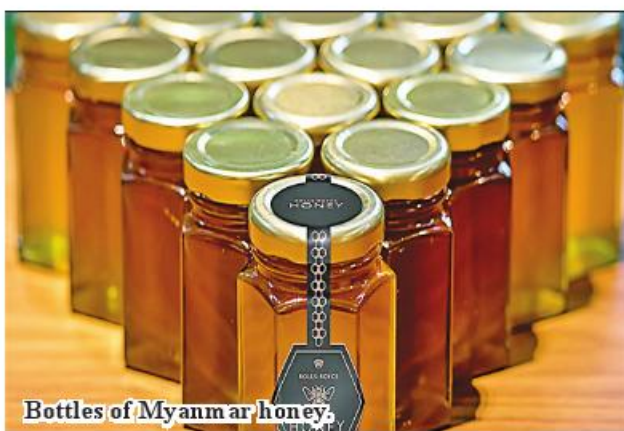
Bottles of Myanmar honey.

Among them, Myanmar ranks 48th accounting for 0.12 percent of the total honey exports. Myanmar exports its honey mostly to Japan, Thailand, the US, South Korea, Singapore and China (Taipei). Among them, Japan tops importing Myan-