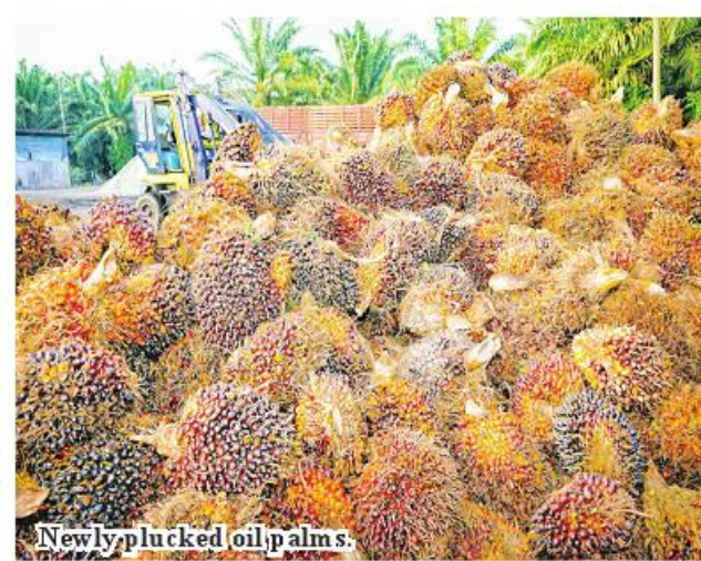
Newly plucked oil palms.

Dawei September 15 More than 39,000 acres of oil palm farming are being cultivated in four districts of Tanintharyi Region from April to August in 2023-2024 FY, according to the reports of the Department of Agriculture released on September 13. Tanintharyi Region alone. Therefore, oil palm farming in Tanintharyi Region has been started for more than thirty years. Currently, there are not only local investments in Tanintharyi Region, but also investments from overseas. About 39 domestic and foreign companies and 40 private farms have planted 395,721 acres of oil palm trees in the region from April to August. They are planted in Dawei, Myeik, Bokpyin and