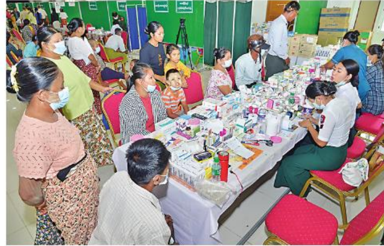
တပ်မတော်နှင့် ကျန်းမာရေးဝန်ကြီးဌာနမှ နယ်လှည့်အထူးဆေးကုသရေးအဖွဲ့က ဒေသခံပြည်သူများကို ကျန်းမာရေးစောင့်ရှောက်မှုလုပ်ငန်းများ ဆောင်ရွက်ပေးစဉ်။

ဖြင့် ကိုဗစ်-၁၉ ရောဂါကာကွယ်ဆေး ထပ်ဆောင်း ထိုးနှံရန်လိုအပ်သူ ၆၃ ဦးကို ကာကွယ်ဆေး ထိုးနှံပေးခြင်းများ ဆောင်ရွက်ပေးသည်။ ယင်းနောက် မျက်စိ ခွဲစိတ်ကုသမှု ခံယူထားသည့် ဒေသခံပြည်သူ များကို ရွှေဘိုတပ်နယ်မှ တာဝန်ရှိသူများက နေကာမျက်မှန်များ တပ်ဆင်ပေးသည်။ ထို့ပြင် လူဝန်မှုကြီးကြပ်ရေးနှင့် ပြည်သူ့ အင်အားဝန်ကြီးဌာန ရွှေဘိုမြို့နယ်ဦးစီးမှူး ရုံးမှ Biometric အချက်အလက်ကောက်ယူ ခြင်းနှင့် UID နံပါတ်ထုတ်ပေးခြင်းလုပ်ငန်း များ ဆောင်ရွက်ခဲ့ကြောင်း သိရသည်။ ထို့ပြင် နယ်လှည့်အထူးဆေးကုသရေး အဖွဲ့ထံသို့လာရောက် ဆေးကုသမှုခံယူနေ သည့် ဒေသခံပြည်သူများ စားသောက်ရေး အဆင်ပြေစေရန်အတွက် တာဝန်ရှိသူများ နှင့် ဒေသခံစေတနာရှင် ပြည်သူများက နေ့လယ်စာဖြင့် ဧည့်ခံကျွေးမွေးကြသည်။ ယင်းသို့ ဆောင်ရွက်ပေးနေမှုများကို ရွှေဘို ခရိုင်စီမံအုပ်ချုပ်ရေးအဖွဲ့ဥက္ကဋ္ဌ၊ ရွှေဘို တပ်နယ်မှ တာဝန်ရှိသူများ၊ ရွှေဘိုမြို့နယ် အုပ်ချုပ်ရေးမှူးနှင့် တာဝန်ရှိသူများက လာရောက်ကြည့်ရှုအားပေးသည်။ နယ်လှည့်အထူးဆေးကုသရေးအဖွဲ့ထံ သို့ လာရောက် ဆေးကုသမှုခံယူနေသည့် ဒေသခံပြည်သူများ၏ စကားသံများကိုလည်း ယခုလိုကြားသိရပါတယ် - “တပ်မတော် နယ်လှည့်ဆေးကုသဖွဲ့ ကနေ ဆေးကုပေးနေတဲ့အကြောင်း ရပ်ကွက် အတွင်း လူတွေသွားရောက်ကုသနေတာသိ