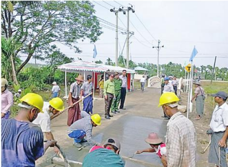
ဖျာပုံမြို့နယ် ကျေးလက်ဒေသဖွံ့ဖြိုး ဦးသန်းလော်စိုးက ပြောပြ၍ သိရသည်။ တိုးတက်ရေးဦးစီးဌာန မြို့နယ်ဦးစီးမှူး သက်စာ

ရှောက်ကြရန် ဆွေးနွေးမှာကြားသည်။ ရှမ်းကွင်းကျေးရွာတွင် အရှည် ပေ ၆၂၀၊ အကျယ် ၁၂ ပေ၊ အမြင့် ၃ နှစ် လက်မရှိ ကွန်ကရစ်လမ်းခင်းခြင်းလုပ်ငန်း ကို ၂၀၂၃-၂၀၂၄ ဘဏ္ဍာနှစ် ကျေးရွာ ဖွံ့ဖြိုးတိုးတက်ရေးလုပ်ငန်းစီမံကိန်း ပံ့ပိုး ရန်ပုံငွေကျပ် သိန်း ၁၅၀၊ ကျေးရွာပြည်သူ ထည်ဝင်ငွေကျပ် သိန်း ၃၀ အသုံးပြု၍ ကျေးလက်ဒေသဖွံ့ဖြိုးတိုးတက်ရေးဦးစီး ဌာန၏ နည်းပညာပံ့ပိုးမှုဖြင့် ကျေးရွာသူ၊ ကျေးရွာသားများကိုယ်တိုင် ယခုနှစ် ဩဂုတ်လ တတိယပတ်မှစတင်ဆောင်ရွက် ခဲ့ရာ ယခုအခါ လုပ်ငန်းများ ၈၀ ရာခိုင် ရှုန်း ဆောင်ရွက်ပြီးစီးနေပြီဖြစ်ကြောင်း