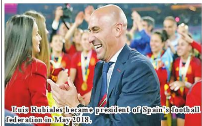
Luis Rubiales became president of Spain's football federation in May 2018.