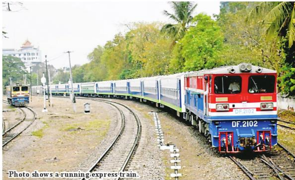
Photo shows a running express train.

Mandalay September 15 Open tenders will be invited to local private entrepreneurs to contract to provide services for restaurant cars of two Yangon-Mandalay express trains, according to the Ministry of Transport and Communications. Myanmar Railways under the ministry is operating two express trains (Nos. 3 and 4) on the Yangon-