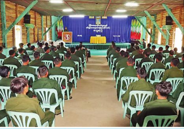
ကြိုငံဒေသတိုင်းစစ်ဌာနချုပ် တိုင်းမှူး ဗိုလ်ချုပ်အောင်ခိုင်ဝင်း မိုင်းခတ်မြို့ နယ်အတွင်းရှိ ပြည်သူ့စစ်(ဌာနေ) တပ်ဖွဲ့ဝင်များကို တွေ့ဆုံအမှာစကားပြောကြားစဉ်။

ဦးစွာ တိုင်းမှူးက အမှာစကား ပြောကြားသည်။ ထို့နောက် ပြည်သူ့စစ် (ဌာနေ)တပ်ဖွဲ့ဝင်များ၏ တင်ပြချက်များ အပေါ် လိုအပ်သည်များ ပေါင်းစပ်ညှိနှိုင်း ဆောင်ရွက်ပေးကာ စားသောက်ဖွယ်ရာများ နှင့် ထောက်ပံ့ငွေများကို ပေးအပ်ခဲ့ကြောင်း သတင်းရရှိသည်။