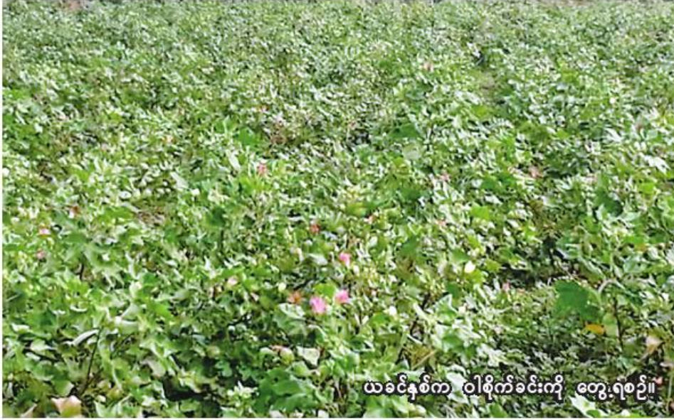
ယခင်နှစ်က ဝါစိုက်ခင်းကို တွေ့ရစဉ်။

မုံရွာ စက်တင်ဘာ ၁၅ စစ်ကိုင်းတိုင်းဒေသကြီး မုံရွာခရိုင် မုံရွာမြို့နယ်တွင် ယခုနှစ် မိုးသီးနှံစိုက်ပျိုးရာသီ၌ စက်မှုကုန်ကြမ်းသီးနှံဖြစ်သည့် ဝါ ၁၅၉၉၇ ကေ စိုက်ပျိုးပြီးစီးပြီဖြစ်ကြောင်း မုံရွာမြို့နယ် စိုက်ပျိုးရေးဦးစီးဌာနမှ သိရသည်။ မုံရွာမြို့နယ်တွင် ယခုနှစ် မိုးသီးနှံစိုက်ပျိုးရာသီ၌ ဝါမျိုးစုံ