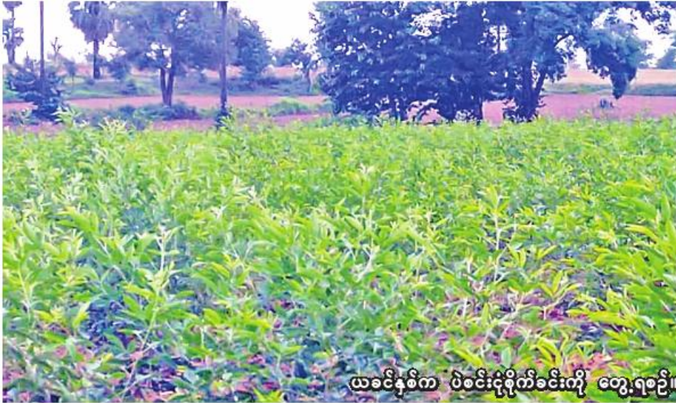
ယင်းမာပင်ခရိုင်တွင် ပဲစင်းငုံစိုက်ပျိုးရေးကို တွေ့ရစဉ်။

ယင်းမာပင် စက်တင်ဘာ ၁၅ စစ်ကိုင်းတိုင်းဒေသကြီး ယင်းမာပင်ခရိုင်တွင် ယခုနှစ် မိုးသီးနှံ စိုက်ပျိုးရာသီ၌ ပဲစင်းငုံ ဉာဏ်ရပ် ကေ စိုက်ပျိုးပြီးစီးပြီဖြစ်ကြောင်း ယင်းမာပင်ခရိုင် စိုက်ပျိုးရေးဦးစီးဌာနမှ သိရသည်။ ယင်းမာပင်ခရိုင်တွင် ယခုနှစ် မိုးသီးနှံစိုက်ပျိုးရာသီ၌ ပဲစင်းငုံ ၈၈၄၉၇ ဧက စိုက်ပျိုးရန် လျာထားပြီး ယနေ့ထိ ပဲစင်းငုံ ၉၁၅၈၆ ဧက စိုက်ပျိုးပြီးစီးပြီဖြစ်ကာ လျာထားကေထက် ပိုမိုစိုက်ပျိုးနိုင်ခဲ့ကြောင်း သိရသည်။