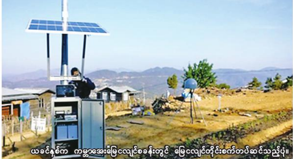
ယခင်နှစ်က ကမ္ဘာအေးမြေလျင်စခန်းတွင် မြေလျင်တိုင်းစက်တပ်ဆင်သည်ပုံ။