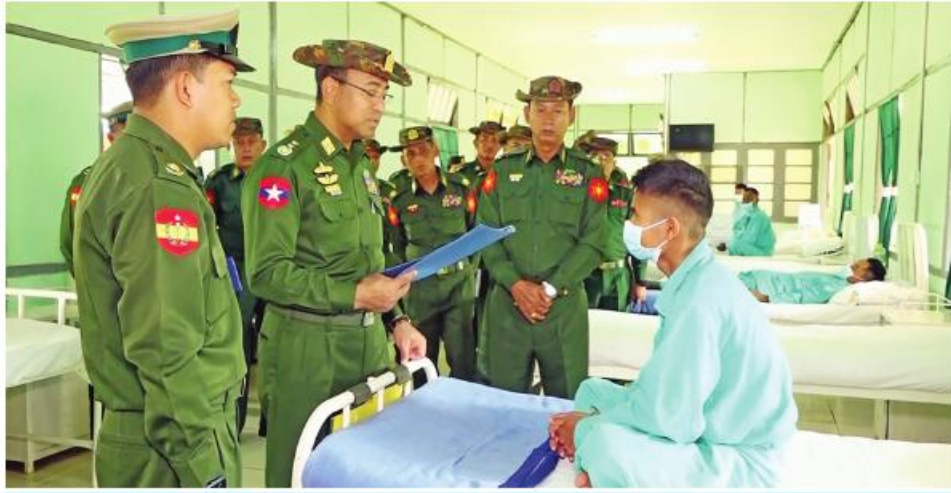
ကာကွယ်ရေးဦးစီးချုပ်ရုံး(ကြည်း)မှ ဒုတိယဗိုလ်ချုပ်ကြီးအောင်အောင် ဆေးကုသမှုခံယူနေသူတစ်ဦးကို ရင်းရင်းနှီးနှီး မေးမြန်းအားပေးစကားပြောကြားစဉ်။

နေပြည်တော် စက်တင်ဘာ ၁၅ ရှမ်းပြည်နယ်(မြောက်ပိုင်း) လားရှိုးမြို့ရှိ တပ်မတော် ဆေးရုံ၌ တက်ရောက်ဆေးကုသမှုခံယူလျက်ရှိသော အရာရှိ စစ်သည်၊ မိသားစုများနှင့် ဒေသခံတိုင်းရင်းသား ပြည်သူများကို ယနေ့ နံနက်ပိုင်းတွင် ကာကွယ်ရေးဦးစီးချုပ်ရုံး(ကြည်း)မှ ဒုတိယဗိုလ်ချုပ်ကြီးအောင်အောင်၊ အရှေ့မြောက်တိုင်းစစ်ဌာနချုပ် တိုင်းမှူး ဗိုလ်ချုပ်ခိုင်နိုင်ဦးနှင့်အဖွဲ့ဝင်များက သွားရောက် ကြည့်ရှု၍ တစ်ဦးချင်း၏ ရောဂါဖြစ်ပွားမှု၊ ဆေးဝါး ကုသပေးထားမှုနှင့် ကျန်းမာရေးတိုးတက်ကောင်းမွန်မှု အခြေအနေများကို ရင်းရင်းနှီးနှီးမေးမြန်း အားပေး စကားပြောကြားကာ စားသောက်ဖွယ်ရာများနှင့် ထောက်ပံ့ငွေများ ပေးအပ်သည်။ ထို့နောက် ဒုတိယဗိုလ်ချုပ်ကြီးအောင်အောင်၊ တိုင်းမှူးနှင့်အဖွဲ့ဝင်များသည် ဆေးရုံအတွင်းလှည့်လည် ကြည့်ရှု၍ လိုအပ်သည်များ ပေါင်းစပ်ညှိနှိုင်းဆောင်ရွက် ပေးသည်။ အလားတူ နေပြည်တော်ကောင်စီနယ်မြေ လေယာ သီရိမြို့နယ်ရှိ တပ်မတော်ဆေးရုံကြီး(ခုတင်-၁၀၀၀)၊ ကချင်ပြည်နယ် မြစ်ကြီးနားမြို့ရှိ တပ်မတော်ဆေးရုံ၊