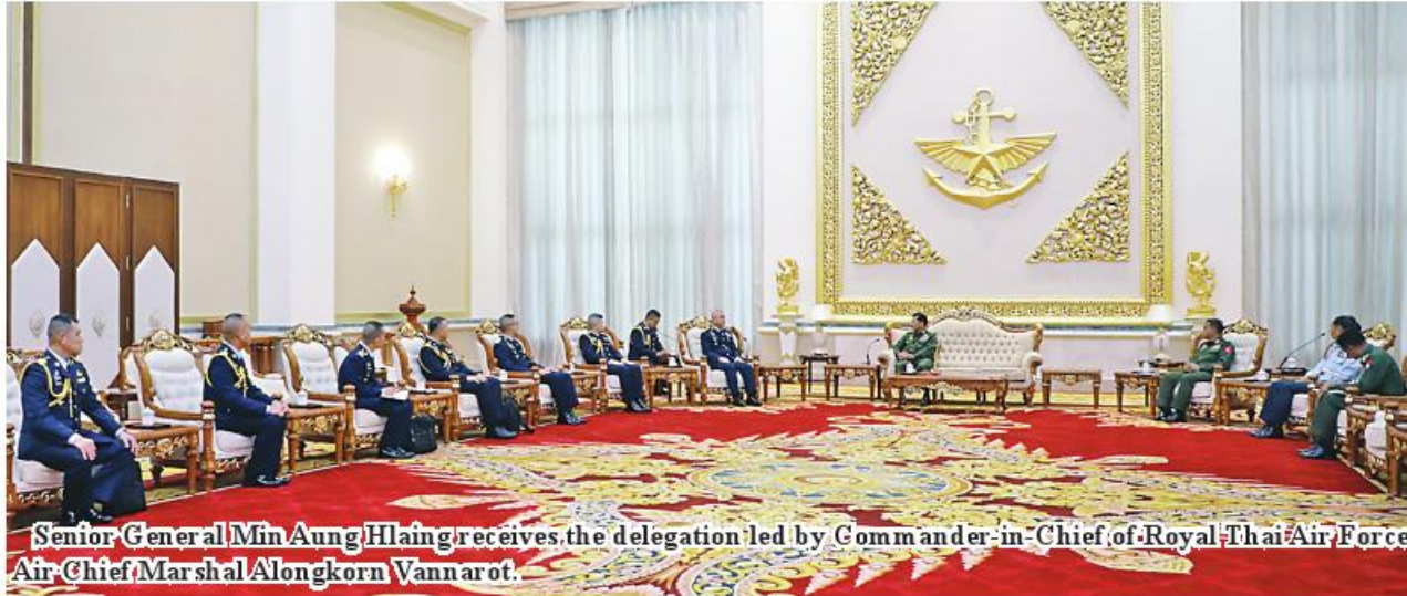
Senior General Min Aung Hlaing receives the delegation led by Commander-in-Chief of Royal Thai Air Force Air Chief Marshal Alongkorn Vannarot.

Nay Pyi Taw September 15 Chairman of the State Administration Council Commander-in-Chief of Defence Services Senior General Min Aung Hlaing received a delegation led by Commander-in-Chief of the Royal Thai Air Force Air Chief Marshal Alongkorn