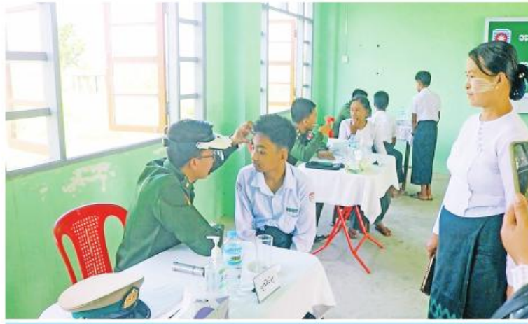
နယ်မြေခံဆေးကုသရေးအဖွဲ့က ဆရာ၊ ဆရာမများနှင့် ကျောင်းသား၊ ကျောင်းသူ များကို ကျန်းမာရေးစောင့်ရှောက်မှုလုပ်ငန်းများ ဆောင်ရွက်ပေးစဉ်။

စေရန် စာသင်ခန်းနှင့် စာသင်ကျောင်းဝင်း အတွင်း ခြင်ဆေးဖျန်းခြင်းလုပ်ငန်းများကို ဆောင်ရွက်ပေးသည်။ ယင်းသို့ ဆောင်ရွက်ပေးနေမှုများကို အနောက်ပိုင်းတိုင်းစစ်ဌာနချုပ် တိုင်းမှူး ဗိုလ်ချုပ်ထင်လတ်ဦးနှင့် တာဝန်ရှိသူများက သွားရောက်ကြည့်ရှုအားပေးပြီး စားသောက် ဖွယ်ရာများ ထောက်ပံ့ပေးအပ်ကာ ကျောင်းသား၊ ကျောင်းသူများ ကျန်းမာ ဖျော်ရွှင်စွာ ပညာသင်ကြားနိုင်ရေးနှင့် ကျောင်းပတ်ဝန်းကျင်သန့်ရှင်းရေးအတွက် ဆောင်ရွက်ရမည့် လုပ်ငန်းများကို တာဝန်ရှိ သူများနှင့် ညှိနှိုင်းဆောင်ရွက်ပေးသည်။ အလားတူ အမ်းမြို့ အမှတ်(၂)အခြေခံ ပညာအထက်တန်းကျောင်းနှင့် တောင် ကုတ်မြို့ အမှတ် (၃)အခြေခံပညာအထက် တန်းကျောင်းတို့မှ ဆရာ၊ ဆရာမများနှင့် ကျောင်းသား၊ ကျောင်းသူများကို နယ်မြေခံ ဆေးကုသရေးအဖွဲ့များက အဆိုပါကျောင်း များ၌ ကျန်းမာရေးစောင့်ရှောက်မှုလုပ်ငန်း များကို ဆောင်ရွက်ပေးရာ တပ်နယ်အလိုက် တာဝန်ရှိသူများက သွားရောက်ကြည့်ရှုအား ပေးပြီး လိုအပ်သည်များညှိနှိုင်း ဆောင်ရွက် ပေးခဲ့ကြောင်း သတင်းရရှိသည်။