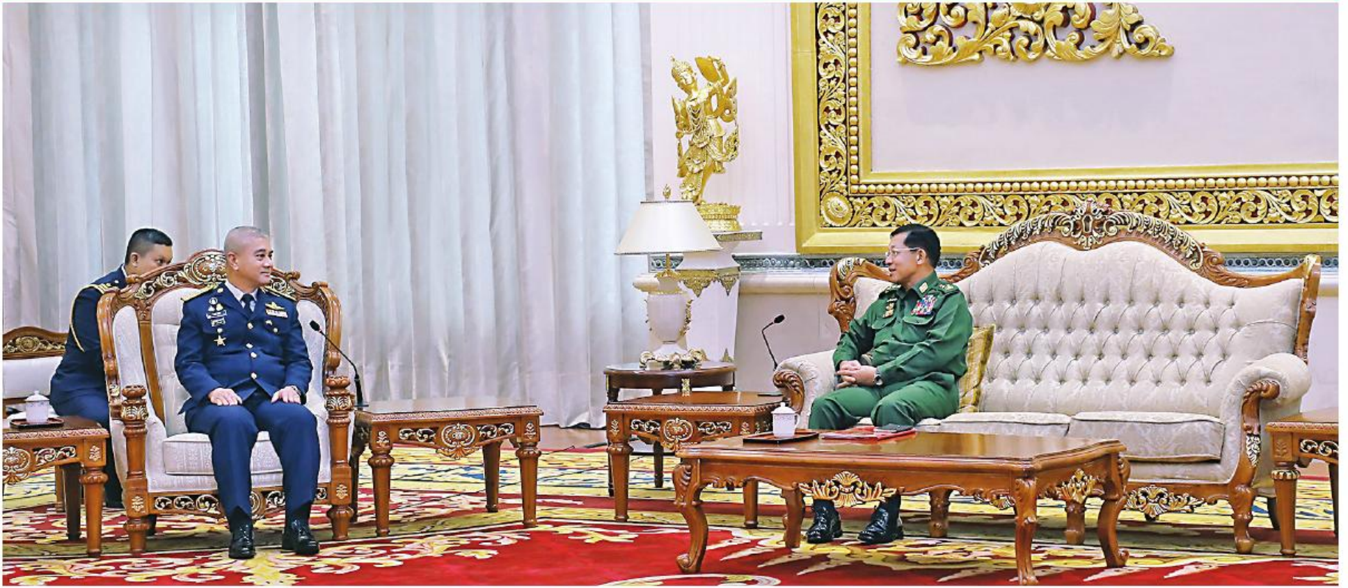
နိုင်ငံတော်စီမံအုပ်ချုပ်ရေးကောင်စီဥက္ကဋ္ဌ တပ်မတော်ကာကွယ်ရေးဦးစီးချုပ် ပိုလ်ချုပ်မှူးကြီးမင်းအောင်လှိုင် ထိုင်းဘုရင့်လေတပ်ဦးစီးချုပ် Air Chief Marshal Alongkorn Vannarot ဦးဆောင်သော ကိုယ်စားလှယ်အဖွဲ့ကို လက်ခံတွေ့ဆုံ

နေပြည်တော် စက်တင်ဘာ ၁၅ ၊ မင်းအောင်လှိုင်သည် မြန်မာနိုင်ငံက အိမ်ရှင်အဖြစ် AACC သို့ တက်ရောက်ခဲ့သည့် ထိုင်းဘုရင့် လွယ်အဖွဲ့ကို ယနေ့နံနက်ပိုင်းတွင် နေပြည်တော်ရှိ နိုင်ငံတော်စီမံအုပ်ချုပ်ရေးကောင်စီ ဥက္ကဋ္ဌ ၊ လက်ခံကျင်းပပြီးစီးခဲ့သည့် အကြိမ်(၂၀)မြောက် လေတပ်ဦးစီးချုပ် Air Chief Marshal လေယာဉ်ခိုခိုမာန်ဧည့်ခန်းမဆောင်၌ လက်ခံ တပ်မတော်ကာကွယ်ရေးဦးစီးချုပ် ပိုလ်ချုပ်မှူးကြီး အာဆီယံလေတပ်ဦးစီးချုပ်များညီလာခံ 20 th Alongkorn Vannarot ဦးဆောင်သောကိုယ်စား တွေ့ဆုံသည်။ စာမျက်နှာ ၁၆ ကော်လံ ၁၂၂