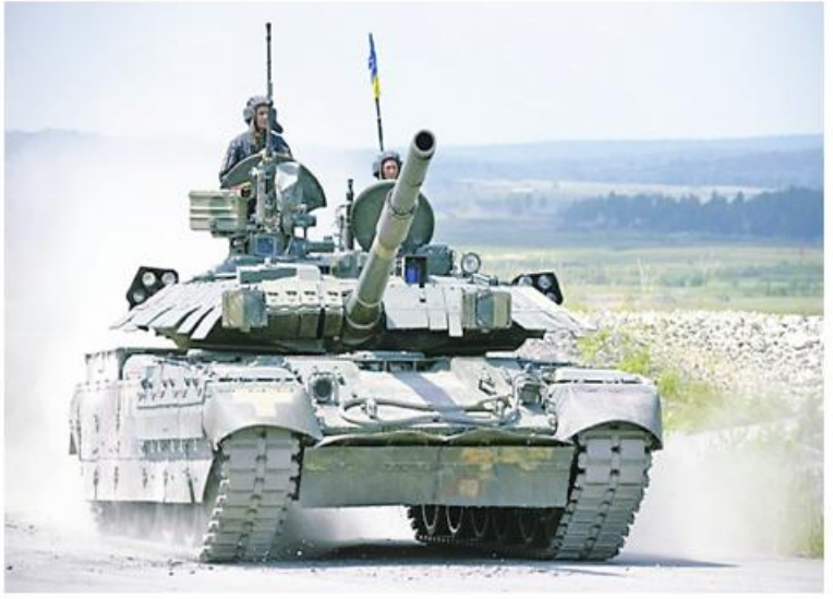
ကတိပြုခဲ့သည်။ $833M for Military Gear ကို Denmark to Give Ukraine ဘာသာပြန်ဆိုထားပါသည်။

နိုင်ငံကိုပေးအပ်ရန် ကတိပြုထားသည့် ဒိန်းမတ်နိုင်ငံ၏ စုစုပေါင်းအကူအညီသည် ခရီးနာ ၁၃ ဒသမ ၆ ဘီလီယံ ဖြစ်သည်။ “ဒီနေ့ထိ ဒိန်းမတ်နိုင်ငံရဲ့ ဘဏ္ဍာရေးဆိုင်ရာ အကြီးမားဆုံးပံ့ပိုးကူညီမှုပေးအပ်သွားနိုင်ဖို့ ကျွန်တော်တို့ လုပ်ဆောင်နေပါတယ်” ဟု ၎င်းက ပြောကြားခဲ့သည်။ ဒိန်းမတ်နိုင်ငံက ယူကရိန်းကို ပံ့ပိုးပေးအပ်မှုများသည် ၁၂ ကြိမ်မြောက်ဖြစ်ပြီး တင့်ကားများ၊ မော်တော်ယာဉ်များ၊ တင့်ကားသုံး ခဲယမ်းမီးကျောက်များနှင့် လေယာဉ်ပစ်ခတ် အမြောက်သေနတ်များ ပါဝင်မည်ဖြစ်သည်။ ဒိန်းမတ်နှင့် နယ်သာလန်နိုင်ငံတို့က ယူကရိန်းသို့ F-16 တိုက်လေယာဉ်များ လွှဲပြောင်းပေးမှုကို အမေရိကန်က အတည်