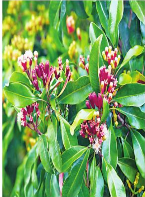
လေးညှင်း အင်္ဂလိပ်အမည် - Clove မျိုးရင်း - Myrtaceae ရုက္ခဗေဒအမည် - Eugenia carryophyllata Thumb.

အဓိကဆေးဖက်ဝင်ပုံ သွားနာ၊ သွားကိုက်၊ အဖျား၊ အနံ့ခြင်း၊ ချောင်းဆိုးခြင်း၊ နှုတ်မမြန်ခြင်း၊ ခံတွင်းနံ့မတောင်းခြင်း၊ အနာပေါက်၊ ရေယုန်နာများအတွက် ကုသရာတွင် ဆေးဖက်ဝင်အသုံးပြုသည်။