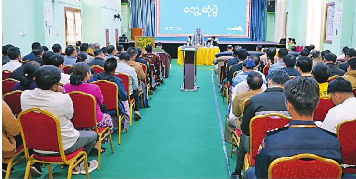
ဟားခါး စက်တင်ဘာ ၁၅

နိုင်ငံတော် စီမံအုပ်ချုပ်ရေးကောင်စီ အဖွဲ့ဝင် ဒေါက်တာမူထန်သည် ချင်းပြည်နယ် ဝန်ကြီးချုပ် ဒေါက်တာဝန်ကြီးထွန်းထွန်း၊ ဌာန ဆိုင်ရာတာဝန်ရှိသူများနှင့် ပြည်နယ်၊ ခရိုင်၊ မြို့နယ်အဆင့် ဌာနဆိုင်ရာဝန်ထမ်း များ၊ မြို့မိမြို့ဖများ၊ လူမှုရေးအသင်းအဖွဲ့ဝင် များ တွေ့ဆုံပွဲကို ယနေ့နံနက်ပိုင်းတွင်