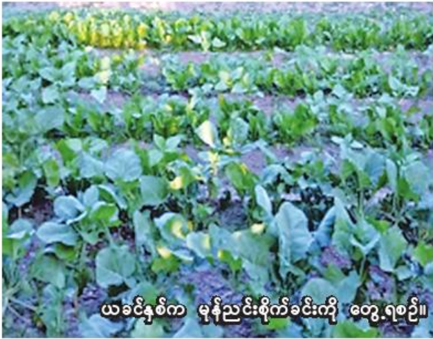
ယခင်နှစ်က မုန့်ညင်းစိုက်ခင်းကို တွေ့ရစဉ်။

ယခုနှစ် ကလေးခရိုင်အတွင်း ဟင်းသီးဟင်းရွက်စိုက်တောင်သူ များကို သက်ဆိုင်ရာမြို့နယ်စိုက်ပျိုး ရေးဦးစီးဌာနက ဟင်းသီးဟင်းရွက် များ တိုးချဲ့စိုက်ပျိုးရေး၊ GAP နည်းစနစ်ဖြင့် စိုက်ပျိုးရေး၊ စိုက် နည်းစနစ်များ မှန်ကန်စေရေး၊ ညီညွတ်သော ဟင်းသီးဟင်းရွက်ရရှိရေး၊ သဘာဝ မြေဩဇာ၊ ပိုးသတ်ဆေးများ ပြုလုပ်သုံးစွဲရေးတို့ကို အသိပညာ ပေး ဆောင်ရွက်လျက်ရှိကြောင်း သိရသည်။ (၂၀၆)