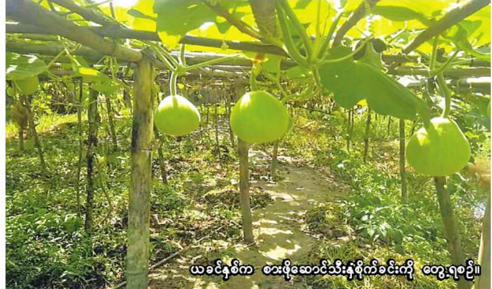
ယခင်နှစ်က စားဖိုဆောင်သီးနှံစိုက်ခင်းကို တွေ့ရစဉ်။