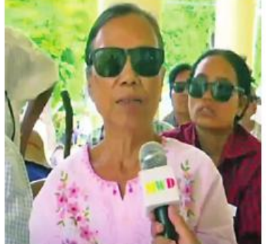
ကြောင့် ဒီကိုလာခွဲလိုက်တာ။ အခုတော့ ကြည်လင်သွားပြီ။ ကောင်းသွားပြီ။ ကျေးဇူး တအားတင်ပါတယ်။ နောင်နှစ်လည်းလာခွဲ ကြပါအုံး။ အဲဒီကျလည်းလာပြပါအုံးမယ်။”

“မျက်စိလည်းကြည်လည်းကြည်ပါတယ်။ ကျေးဇူးလည်းတင်ပါတယ်။ အမြဲတမ်းလည်း ဆုတောင်းပေးမယ်။မျက်စိခွဲတာ တစ်ဖက် က ခွဲပြီးသား။ ကျန်တစ်ဖက်က မမြင်ရလို့ လုံးဝကို မမြင်ရသလောက်ပါ။ အရိပ် အယောင်လောက်ပဲမြင်ရတယ်။ အဲဒါ