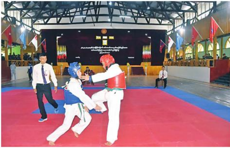
အကြိမ်(၃၀)မြောက် တပ်မတော်ကာကွယ်ရေးဦးစီးချုပ်ဖလား တပ်မတော်(ကြည်း၊ ရေ၊ လေ) တိုက်ကွမ်ဒိုပြိုင်ပွဲ ယှဉ်ပြိုင်ကစားနေမှုကို တွေ့ရစဉ်။

နေပြည်တော် စက်တင်ဘာ ၁၅ - တပ်မတော်(ကြည်း၊ ရေ၊ လေ) တိုက်ကွမ်ဒို ၂၀၂၂-၂၀၂၃ ခုနှစ်အကြိမ်(၃၀)မြောက် ပြိုင်ပွဲ ဖွင့်ပွဲကို ယနေ့နံနက်ပိုင်းတွင် တပ်မတော် ကာကွယ်ရေးဦးစီးချုပ်ဖလား တောင်ပိုင်းတိုင်းစစ်ဌာနချုပ် အေးချမ်းမြို့၊