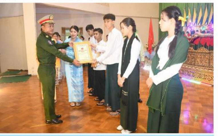
အရှေ့တောင်တိုင်းစစ်ဌာနချုပ် တိုင်းမှူး ဗိုလ်မှူးချစ်စိုးမင်း မွန်ပြည်နယ် (၂၄)ကြိမ်မြောက် မြန်မာ့ရိုးရာယဉ်ကျေးမှု အဆို၊ အက၊ အရေး၊ အတီး ပြိုင်ပွဲတွင် ဆုရရှိသူများကို ဆုများပေးအပ်ချီးမြှင့်စဉ်။

ကျင်းပမှုအခြေအနေများကို ရှင်းလင်းတင်ပြ သည်။ထို့နောက်ပြည်နယ်ဝန်ကြီးချုပ်၊ တိုင်းမှူး နှင့် တာဝန်ရှိသူများက ပြိုင်ပွဲတွင် ဆုရရှိ သူများကို ဆုများအသီးသီးချီးမြှင့်ကြသည်။ ယင်းနောက် ပြည်နယ်ဝန်ကြီးချုပ်၊ တိုင်းမှူးနှင့် တက်ရောက်လာကြသူများက ဆုရရှိသည့် ပြိုင်ပွဲဝင်များ၏ ကပြဖျော်ဖြေ တင်ဆက်မှုများကို ကြည့်ရှုအားပေးပြီး ပြည်နယ်ဝန်ကြီးချုပ်က ကပြဖျော်ဖြေတင် ဆက်ကြသူများကို ဂုဏ်ပြုပုန်းခြင်း ပေးအပ် ကာ ဗဟိုအဆင့်သို့သွားရောက်ယှဉ်ပြိုင်မည့် အသင်းခေါင်းဆောင်ကို အောင်နိုင်ရေး အလံပေးအပ်ခဲ့ကြောင်း သတင်းရရှိသည်။