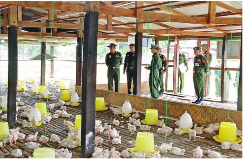
ကာကွယ်ရေးဦးစီးချုပ်ရုံး(ကြည်း)မှ ဒုတိယဗိုလ်ချုပ်ကြီးအောင်အောင် နယ်မြေခံတပ်ရင်း၌ စိုက်ပျိုး မွေးမြူရေးလုပ်ငန်းများ ဆောင်ရွက်ထားရှိမှုကို ကြည့်ရှုစစ်ဆေးစဉ်။

နေပြည်တော် စက်တင်ဘာ ၁၅ ဒေသတွင်းစားရေရိက္ခာဖူလုံစေရန်နှင့် ပြည်သူများ ၏ စားသောက်ရေးကို အထောက်အကူဖြစ်စေရန် အတွက် တိုင်းစစ်ဌာနချုပ်များ၊ တပ်ရင်း၊ တပ်ဖွဲ့များ၌ စိုက်ပျိုးမွေးမြူရေးလုပ်ငန်းများကို ကြိုးပမ်းဆောင်ရွက် လျက်ရှိသည်။ ထိုသို့ ဆောင်ရွက်လျက်ရှိရာ ယနေ့ နံနက်ပိုင်းတွင် ကာကွယ်ရေးဦးစီးချုပ်ရုံး(ကြည်း)မှ ဒုတိယဗိုလ်ချုပ်ကြီး အောင်အောင်၊ အရှေ့မြောက်တိုင်းစစ်ဌာနချုပ် တိုင်းမှူး ဗိုလ်ချုပ်ခိုင်နိုင်ဦးနှင့် တာဝန်ရှိသူများက ရှမ်းပြည်နယ်(မြောက်ပိုင်း) လားရှိုးမြို့ နယ်မြေခံတပ်ရင်း ဆောင်ရွက်ပေးခဲ့ကြောင်း သတင်းရရှိသည်။ ရှိ (ဖရီရန်)နို့စားခွား မွေးမြူထားရှိမှု၊ ဆိတ်မွေးမြူ ထားရှိမှု၊ DYL အသားတိုးဝက်မွေးမြူထားရှိမှု၊ ငါး ဆေးထိုးသားဖောက်မွေးမြူရေးလုပ်ငန်း ဆောင်ရွက် ထားမှု၊ တစ်သျှူးငှက်ပျောစိုက်ပျိုးရေးလုပ်ငန်း၊ အစေ့ ထုတ်ပြောင်းစိုက်ပျိုးရေးလုပ်ငန်း၊ မိုးစပါးစိုက်ပျိုးရေး လုပ်ငန်း၊ နေပီယာမြက်စိုက်ပျိုးရေးလုပ်ငန်းနှင့် ရာသီ သီးနှံများ စိုက်ပျိုးထားရှိမှုတို့ကို သွားရောက်ကြည့်ရှု စစ်ဆေးပြီး တာဝန်ရှိသူများနှင့်တွေ့ဆုံကာ ကုန်ထုတ် လုပ်မှုလုပ်ငန်းများ ရာနှုန်းပြည့်အောင်မြင်အောင် ဆောင်ရွက်နိုင်ရေးလိုအပ်သည်များ ပေါင်းစပ်ညှိနှိုင်း ဆောင်ရွက်ပေးခဲ့ကြောင်း သတင်းရရှိသည်။