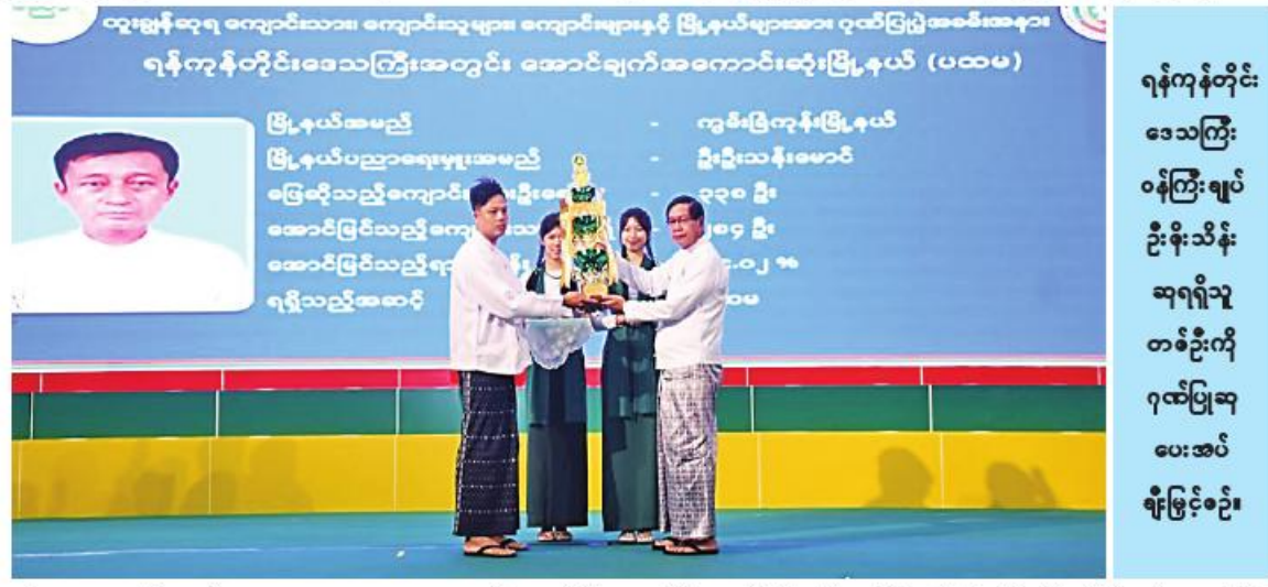
ကျောင်းသား၊ ကျောင်းသူများက ပညာရည် ထူးချွန် လူရည်မွန်သီချင်းဖြင့် ဖျော်ဖြေ တင်ဆက်ပြီး တိုင်းဒေသကြီး ဝန်ကြီးချုပ်က အဖွဲ့အမှတ်စကားပြောကြားသည်။

ကျောင်းသား၊ ကျောင်းသူများက ပညာရည် ထူးချွန် လူရည်မွန်သီချင်းဖြင့် ဖျော်ဖြေ တင်ဆက်ပြီး တိုင်းဒေသကြီး ဝန်ကြီးချုပ်က အဖွဲ့အမှတ်စကားပြောကြားသည်။ ထို့နောက် ရန်ကုန်တိုင်းဒေသကြီး ပညာရေးမှူးရုံးမှ တာဝန်ရှိသူတစ်ဦးက ဆုချီးမြှင့်ပွဲနှင့် ပတ်သက်၍ ရှင်းလင်း ပြောကြားသည်။ ယင်းနောက် ရန်ကုန်တိုင်း ဒေသကြီးမှ ၂၀၂၃ ခုနှစ် တက္ကသိုလ်ဝင် စာမေးပွဲအောင်မြင်သူများအနက် တိုင်း ဒေသကြီးအဆင့် သိပ္ပံဘာသာတွဲ၊ ဝိပဿနာဘာသာတွဲ၊ ဝိဇ္ဇာဘာသာတွဲများတွင် အမှတ်အများဆုံးဆုရရှိသူ ကျောင်းသား၊ ကျောင်းသူများ၊ ရန်ကုန်တိုင်းဒေသကြီး အတွင်းမှ အောင်ချက်အကောင်းဆုံး မြို့နယ် များ၊ အောင်ချက်အကောင်းဆုံး အထက် တန်းကျောင်းများ၊ အထက်တန်းကျောင်းခွဲ များ၊ တက္ကသိုလ်စာမေးပွဲအောင်မြင်သူများ အနက် ခြောက်ဘာသာဂုဏ်ထူးရှင်များ၊