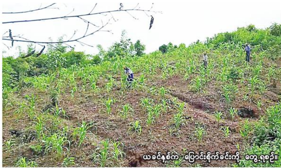
ယခင်နှစ်က ပြောင်းစိုက်ခင်းကို တွေ့ရစဉ်။