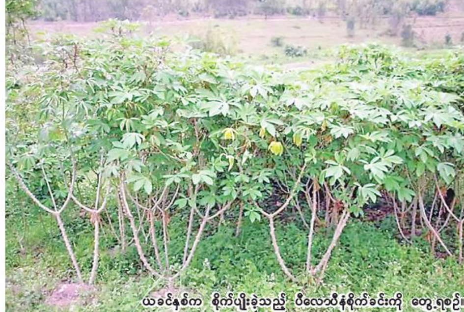
ယခင်နှစ်က စိုက်ပျိုးခဲ့သည့် ပီလောပီနံစိုက်ခင်းကို တွေ့ရစဉ်။

ကျိုပျော်မြို့နယ်တွင် ယခုနှစ် မိုးသီးနှံစိုက်ပျိုးရာသီ၌ ပီလောပီနံကို ၁၆၉၀၂ ဧကစိုက်ပျိုးရန်လျာထားပြီး မေလပထမပတ်က စတင်စိုက်ပျိုးခဲ့ရာ ယနေ့တွင် ရာနှုန်းပြည့် စိုက်ပျိုးပြီးစီးပြီးဖြစ်ကြောင်း သိရသည်။ “စိုက်ပျိုးရေးဦးစီးဌာနအနေနဲ့ မိုးသီးနှံတွေ ရာနှုန်းပြည့်စိုက်ပျိုးနိုင်ဖို့နဲ့ သီးနှံတွေအားလုံးအတွက် မြေဩဇာ၊ ပိုးသတ်ဆေး၊ ပေါင်းသတ်ဆေးတွေကို အချိုးကျအသုံးပြုတတ်စေဖို့၊ စိုက်ပျိုးထားတဲ့သီးနှံတွေ ပိုးမွှားရောဂါမကျရောက်စေဖို့ ဝန်ထမ်းတွေက ကြိုတင်တွင်းဆင်းနည်းပညာပေး လုပ်ငန်းတွေကို ဆောင်ရွက်ပေးခဲ့ပါတယ်။ တောင်သူတွေကလဲ ပီလောပီနံစိုက်ပျိုး