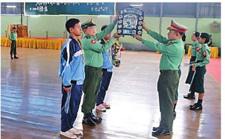
အရှေ့ပိုင်းတိုင်းစစ်ဌာနချုပ် ဒုတိယတိုင်းမှူး ဝိုင်းမှူးချုပ်ဝင်းလှစိုး ခိုင်းဆုပေးပွဲအထိမ်းအမှတ်ပေးအပ်ခြင်းဖြစ်သည်။

နေပြည်တော် စက်တင်ဘာ ၄ - အရှေ့ပိုင်းတိုင်းစစ်ဌာနချုပ် ၂၀၂၃ ခုနှစ် တိုင်းမှူးခိုင်း ပိုက်ကျော်ခြင်းပြိုင်ပွဲ ဝိုင်းလှပွဲနှင့်ဆုပေးပွဲကို ယနေ့နံနက်ပိုင်းတွင် တိုင်းစစ်ဌာနချုပ် အားကစားခန်းမ၌ ပြုလုပ်ရာ ဒုတိယတိုင်းမှူး ဝိုင်းမှူးချုပ် ဝင်းလှစိုးနှင့် တာဝန်ရှိသူများ၊ အရာရှိ၊ စစ်သည်၊ မိသားစုများ၊ ခိုင်းအဖွဲ့ဝင်များနှင့် ပြိုင်ပွဲဝင်အားကစားသမားများ တက်ရောက်ကြသည်။ ဦးစွာ ဒုတိယတိုင်းမှူးနှင့် တက်ရောက်