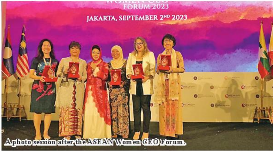
A photo session after the ASEAN Women CEO Forum.