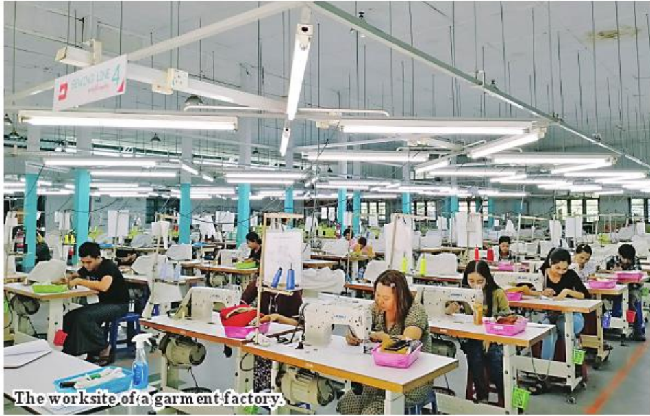
The worksite of a garment factory.