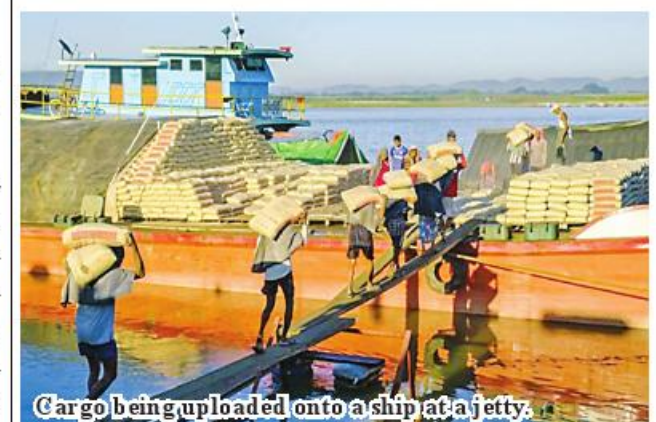
Cargo being uploaded onto a ship at a jetty.