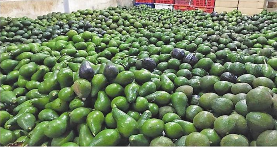
ရန်ကုန် စက်တင်ဘာ ၄ - မြန်မာ့ထောပတ်သီးနှင့် ထောပတ်သီးအဆီကို GCC အဖွဲ့ဝင် နိုင်ငံတစ်နိုင်ငံ ဘာရိန်းနိုင်ငံက ဝယ်ယူတင်သွင်း ရန် ကမ်းလှမ်းထားပြီး လာမည့်အောက်တိုဘာလတွင် စမ်းသပ်တင်ပို့မှုများ ဆောင်ရွက်သွားမည်ဖြစ်ကြောင်း မြန်မာနိုင်ငံ ထောပတ်သီး စိုက်ပျိုးထုတ်လုပ်တင်ပို့ ရောင်းချသူများအသင်း (MAVO)မှ သိရသည်။