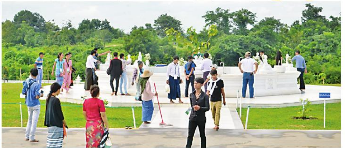
မာရဝိဇယဗုဒ္ဓရုပ်ပွားတော်မြတ်ကြီးအား အနယ်နယ်အရပ်ရပ်မှ လာရောက်ဖူးမြော်ကြည်ညိုကြသည့် ရဟန်းရှင်လူ ဘုရားဖူးလာပြည်သူများဖြင့် စည်ကားနေမှုကို တွေ့မြင်ရစဉ်။

နေပြည်တော် စက်တင်ဘာ ၄ ပြည်ထောင်စုနယ်မြေ နေပြည်တော် ဒေသခံသိရိမြို့နယ်ရှိ ဗုဒ္ဓဥယျာဉ် ဝတ္ထုကံတော်တွင် တည်ထားပူဇော်ထားရှိသည့် ကမ္ဘာပေါ်ရှိ ထိုင်တော်မူ ကျောက်ဆစ်ဗုဒ္ဓရုပ်ပွားတော်များအနက် ဉာဏ်တော် အမြင့်ဆုံးဖြစ်တော်မူသော မာရဝိဇယဗုဒ္ဓရုပ်ပွားတော်မြတ်ကြီး၌ ယနေ့တွင်လည်း ပြည်တွင်း၊ ပြည်ပ အနယ်နယ် အရပ်ရပ်မှ လာရောက်ဖူးမြော်ကြည်ညိုကြသည့် ရဟန်းရှင်လူ ဘုရားဖူးပြည်သူများဖြင့် စည်ကားလှက်ရှိသည်။