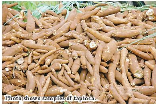
Photo shows samples of tapioca.