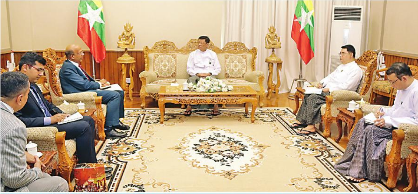
နိုင်ငံတော်စီမံအုပ်ချုပ်ရေးကောင်စီဝင် ဒုတိယဝန်ကြီးချုပ်နှင့် ပို့ဆောင်ရေးနှင့်ဆက်သွယ်ရေးဝန်ကြီးဌာန ပြည်ထောင်စုဝန်ကြီး ဗိုလ်ချုပ်ကြီးမြထွန်းဦး မြန်မာနိုင်ငံဆိုင်ရာ အိန္ဒိယနိုင်ငံသံအမတ်ကြီး H.E Mr. Vinay Kumar ကို လက်ခံတွေ့ဆုံစဉ်။

နေပြည်တော် စက်တင်ဘာ ၄ ၊ ယနေ့မုန်းလွဲပိုင်းက နေပြည်တော် ပို့ဆောင်ရေးနှင့် ဆက်သွယ်ရေးဝန်ကြီးဌာနရုံးအမှတ်(၅)တွင် လက်ခံတွေ့ဆုံသည်။ မြန်မာ-အိန္ဒိယ နှစ်နိုင်ငံအကြား ပို့ဆောင်ရေးနှင့်ဆက်သွယ်ရေးကဏ္ဍတွင် ပူးပေါင်းဆောင်ရွက်မှုများကို ခင်မင်ရင်းနှီးစွာနှစ်ဖက်အမြင်ချင်းဖလှယ်ဆွေးနွေးခဲ့ကြသည်။ တွေ့ဆုံပွဲသို့ ပို့ဆောင်ရေးနှင့် ဆက်သွယ်ရေးဝန်ကြီးဌာန အရာရှိကြီးများနှင့် မြန်မာနိုင်ငံဆိုင်ရာ အိန္ဒိယနိုင်ငံသံရုံးမှ ကိုယ်စားလှယ်များတက်ရောက်ခဲ့ကြောင်း သတင်းရရှိသည်။ (သတင်းစဉ်)