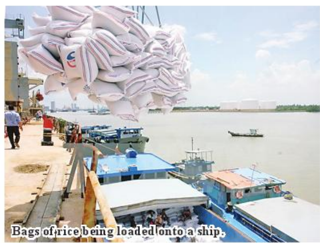
Bags of rice being loaded onto a ship.

Nay Pyi Taw September 4 Myanmar exported more than 370,000 tons of rice and broken rice to customer countries from April to August this financial year, and earning more than US$160 million, according to the Myanmar Rice Federation. During the period, Myanmar sent 379,384 tons of rice and broken rice and bagged US$ 166 million of incomes. In this regard, 87,648 tons of rice and broken rice were sold in April, 110,706