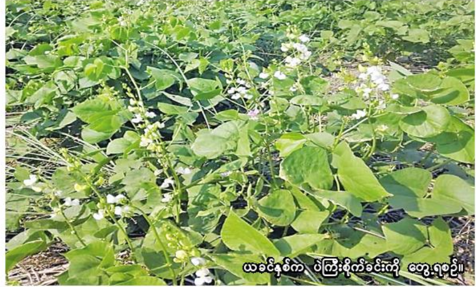
ယခင်နှစ်က ပဲကြီးစိုက်ခင်းကို တွေ့ရစဉ်။

စစ်ကိုင်း စက်တင်ဘာ ၄ စစ်ကိုင်းတိုင်းဒေသကြီး စစ်ကိုင်းခရိုင် မြင်းမူမြို့နယ်တွင် ယခုနှစ် မိုးသီးနှံစိုက်ပျိုးရာသီ၌ ပဲမျိုးစုံ ကေ ၄၆၈၀၀ စိုက်ပျိုးပြီးစီးပြီဖြစ်ကြောင်း စစ်ကိုင်းခရိုင် စိုက်ပျိုးရေးဦးစီးဌာနမှ သိရသည်။ မြင်းမူမြို့နယ်တွင် ယခုနှစ် မိုးသီးနှံစိုက်ပျိုးရာသီ၌ ပဲမျိုးစုံ ၅၇၃၈၁ ကေစိုက်ပျိုးရန် လျာထား