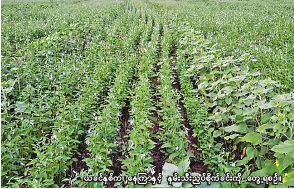
ယခင်နှစ်က ဂရုကြောနှင့် နှမ်းသီးညှပ်စိုက်ခင်းကို တွေ့ရစဉ်။

ကသာ ဧကတင်အာ ၄ စစ်ကိုင်းတိုင်းဒေသကြီး ကသာ ခရိုင်တွင် ယခုနှစ် မိုးသီးနှံစိုက်ပျိုး ရာသီ၌ ဆီထွက်သီးနှံ ၂၀၇၃ ကေ စိုက်ပျိုးပြီးစီးပြီဖြစ်ကြောင်း ကသာ ခရိုင် စိုက်ပျိုးရေးဦးစီးဌာနမှ သိရသည်။ ကသာခရိုင်တွင် ယခုနှစ် မိုး သီးနှံစိုက်ပျိုးရာသီ၌ ဆီထွက်သီးနှံ ၁၆၁၃ ကေစိုက်ပျိုးရန် လျာထားပြီး ယခုနှစ် ဇွန်လမှစတင်၍ စိုက်ပျိုး ခဲ့ရာ ယနေ့ထိ ၂၀၇၃ ကေ စိုက်