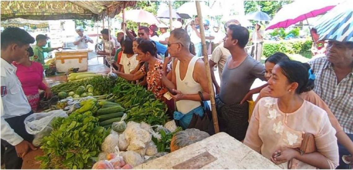
စစ်တွေမြို့ရှိ မုန်တိုင်းဒဏ်သင့် ပြည်သူများအား ဆန်၊ ဆီ၊ ဆား၊ ကြက်ဥ၊ ဟင်းသီးဟင်းရွက်များ၊ စားသောက်ကုန် ပစ္စည်းများနှင့် လူသုံးကုန်ပစ္စည်းများကို ဈေးနှုန်းသက်သာစွာဖြင့် ရောင်းချပေးစဉ်။

နေပြည်တော် စက်တင်ဘာ ၄ ဆိုင်ကလုနီးမုန်တိုင်း(မိုခါ) တိုက်ခတ်မှုကြောင့် မုန်တိုင်းဒဏ်သင့်ဒေသခံပြည်သူများနှင့် ဌာနဆိုင်ရာဝန်ထမ်းများ၏ စားသောက်ရေးအဆင်ပြေစေရန်နှင့် မိမိတို့အလိုရှိရာ စားသောက်ကုန်ပစ္စည်းများကို ဈေးနှုန်းသက်သာစွာဖြင့် ဝယ်ယူစားသောက်နိုင်ရေးအတွက် အနောက်ပိုင်းတိုင်းစစ်ဌာနချုပ် နယ်မြေခံတပ်မတော်သားများနှင့် တာဝန်ရှိသူများက နေ့စဉ်ရောင်းချပေးလျက်ရှိသည်။ ယနေ့တွင်လည်း စစ်တွေမြို့ ဦးဥတ္တမပန်းခြံ၌ အခြေခံစားသောက်ကုန်များဖြစ်သည့်