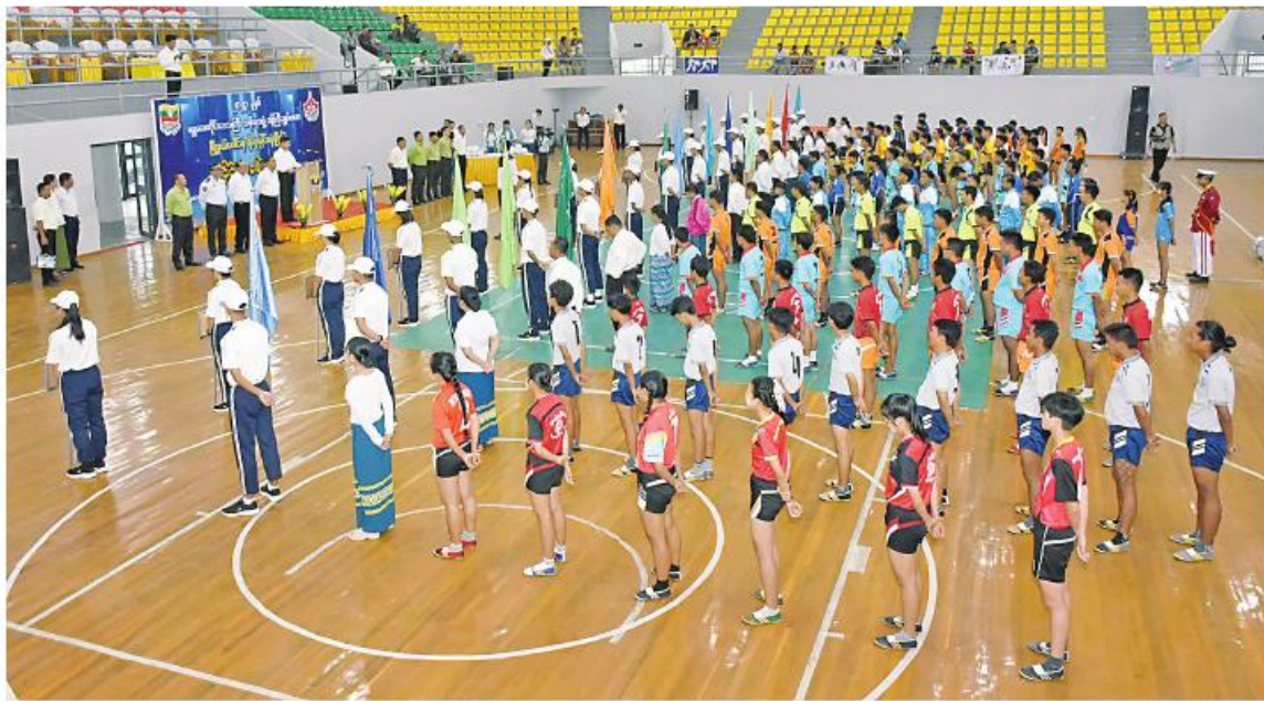
မန္တလေး၊ စက်တင်ဘာ ၁

၂၀၂၃ ခုနှစ် မန္တလေးတိုင်းဒေသကြီး ဝန်ကြီးချုပ်ဖလား မြို့နယ်ပေါင်းစုံ အမျိုးသား၊ အမျိုးသမီး ရိုးရာခြင်းလုံးပြိုင်ပွဲ ဖွင့်ပွဲအခမ်းအနားကို ယနေ့နံနက်ပိုင်းက ချမ်းအေးသာစံမြို့နယ် ဝဏ္ဏမိုးလုံလေလုံ