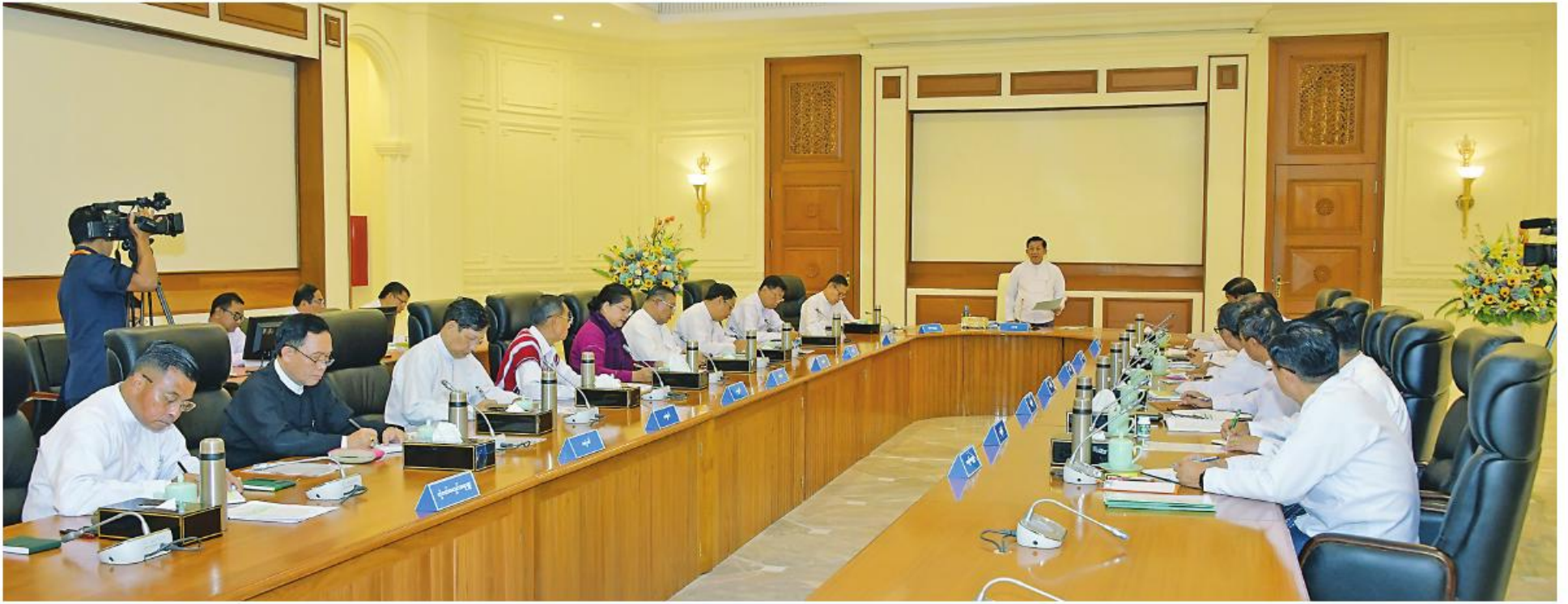
နိုင်ငံတော်စီမံအုပ်ချုပ်ရေးကောင်စီဥက္ကဋ္ဌ နိုင်ငံတော်ဝန်ကြီးချုပ် ပိုလ်ချုပ်မှူးကြီးမင်းအောင်လှိုင် နိုင်ငံတော်စီမံအုပ်ချုပ်ရေးကောင်စီ အစည်းအဝေး (၃/၂၀၂၃)တွင် အမှာစကားပြောကြားစဉ်။

နေပြည်တော် စက်တင်ဘာ ၁ မင်းအောင်လှိုင် တက်ရောက်အမှာစကားပြောကြားသည်။ နိုင်ငံတော်စီမံအုပ်ချုပ်ရေးကောင်စီ အစည်းအဝေး (၃/၂၀၂၃)ကို ယနေ့နံနက်ပိုင်းတွင် နေပြည်တော်ရှိ နိုင်ငံတော်စီမံအုပ်ချုပ်ရေးကောင်စီဥက္ကဋ္ဌရုံးအစည်းအဝေးခန်းမ၌ ကျင်းပပြုလုပ်ရာ နိုင်ငံတော်စီမံအုပ်ချုပ်ရေးကောင်စီဥက္ကဋ္ဌ နိုင်ငံတော်ဝန်ကြီးချုပ် ပိုလ်ချုပ်မှူးကြီးမင်းအောင်လှိုင် တက်ရောက်အမှာစကားပြောကြားသည်။ အစည်းအဝေးသို့ နိုင်ငံတော်စီမံအုပ်ချုပ်ရေးကောင်စီဒုတိယဥက္ကဋ္ဌ ဒုတိယဝန်ကြီးချုပ် ဒုတိယပိုလ်ချုပ်မှူးကြီးစိုးဝင်း၊ အတွင်းရေးမှူး ဒုတိယပိုလ်ချုပ်ကြီးအောင်လင်းဇွေး၊ တွဲဖက်အတွင်းရေးမှူး ဒုတိယပိုလ်ချုပ်ကြီးရဲဝင်းဦး၊ ကောင်စီအဖွဲ့ဝင်များနှင့် တာဝန်ရှိသူများ တက်ရောက်ကြသည်။ ဒီမိုကရေစီနှင့်ဖက်ဒရယ်စနစ်ကို အခြေခံသည့် ပြည်ထောင်စုတည်ဆောက်ရာတွင် တိုင်းရင်းသား ပြည်သူများအားလုံး ပညာတတ်များဖြစ်ရန်လို ဦးစွာ နိုင်ငံတော်စီမံအုပ်ချုပ်ရေးကောင်စီဥက္ကဋ္ဌ နိုင်ငံတော်ဝန်ကြီးချုပ်က အဖွင့်အမှာစကား ပြောကြားရာတွင် နိုင်ငံတော်ကို နိုင်ငံရေးအရ အရေးပေါ်အခြေအနေ ခြောက်လသက်တမ်းတိုးပြီး ချိန်တွင် အသစ်ထပ်မံဖွဲ့စည်းသည့် ကောင်စီဝင်များဖြင့် ဒုတိယအကြိမ်ပြုလုပ်သည့်အစည်းအဝေးဖြစ်ကြောင်း၊ မိမိတို့တာဝန်ယူဆောင်ရွက်နေချိန်အတွင်း နိုင်ငံတော်ကို ပုံမှန်လမ်းကြောင်းအတိုင်း ဖြစ်စေရန်နှင့် စာမျက်နှာ ၁၆ ကော်လံ ၁၂၃