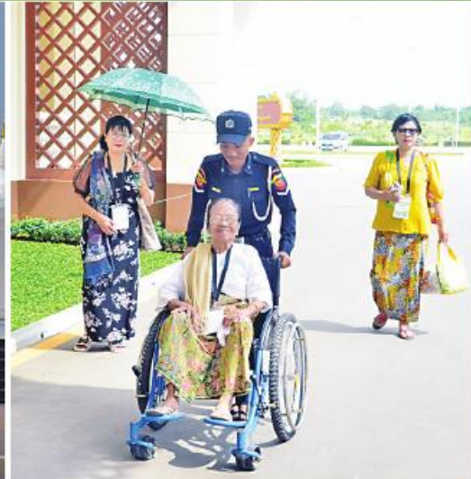
မာရဝိဇယ ဗုဒ္ဓရုပ်ပွားတော် မြတ်ကြီးအား အနယ်နယ် အရပ်ရပ်မှ လာရောက်ဖူးမြော် ကြည်ညိုကြသည့် ရဟန်းရှင်လူ ဘုရားဖူးလာ ပြည်သူများဖြင့် စည်ကားနေမှုကို တွေ့မြင်ရစဉ်။