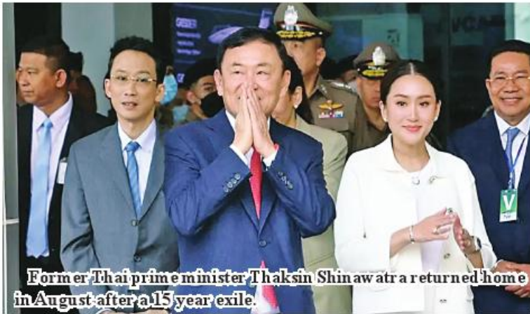
Former Thai prime minister Thaksin Shinawatra returned home in August after a 15-year exile.