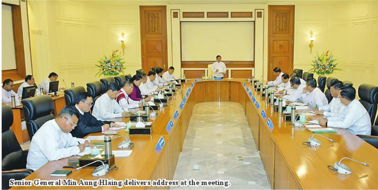
Senior General Min Aung Hlaing delivers address at the meeting.

Nay Pyi Taw September 1 The State Administration Council held meeting 3/2023 at the meeting hall of the SAC Chairman Office in Nay Pyi Taw this morning, with an address by SAC Chairman Prime Minister Senior General Min Aung Hlaing.