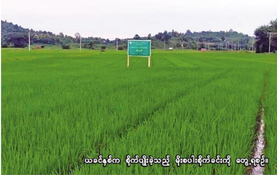
ယခင်နှစ်က စိုက်ပျိုးခဲ့သည့် မိုးစပါးစိုက်ခင်းကို တွေ့ရစဉ်။