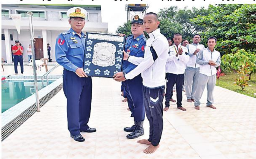
ကာကွယ်ရေးဦးစီးချုပ်(ရေ) ဗိုလ်ချုပ်ကြီး ဖိုးအောင် ရေတပ် လေ့ကျင့်ရေး ဌာနချုပ် အသင်းကို တံခွန်စိုက်ခိုင်းဆု ပေးအပ်ချီးမြှင့်စဉ်။

နေပြည်တော် စက်တင်ဘာ ၁ ၂၀၂၃ ခုနှစ် ကာကွယ်ရေးဦးစီးချုပ်(ရေ)တံခွန်စိုက်ခိုင်း ရေးကျေးပြိုင်ပွဲ ပိုလ်လှပွဲနှင့် ဆုပေးပွဲကို ယနေ့နံနက်ပိုင်းတွင်