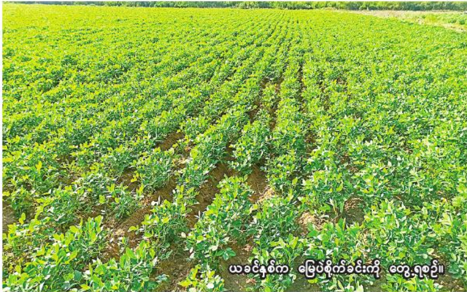
ယခုနှစ်က မြေပဲစိုက်ခင်းကို တွေ့ရစဉ်။

က ပြောပြသည်။ ပြီးခဲ့သည့်နှစ် မိုးသီးနှံစိုက်ပျိုးရာသီက ဘုတလင်မြို့နယ်တွင် မြေပဲကို ၂၀၂၂ ခုနှစ် ဇွန်လမှစတင်၍ စက်တင်ဘာလထိ စိုက်ပျိုးခဲ့ကြရာ မိုးမြေပဲ ၃၅၇၈၂ ဧက စိုက်ပျိုးနိုင်ခဲ့ကြောင်း သိရသည်။