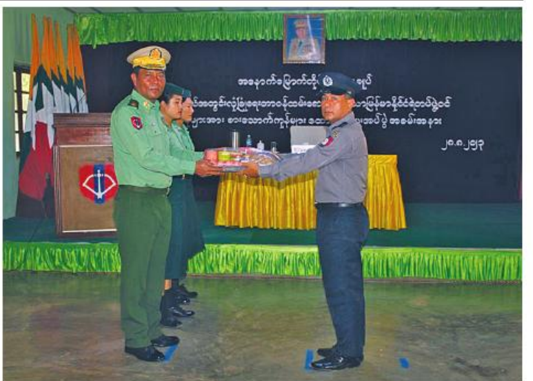
အနောက်မြောက်တိုင်းစစ်ဌာနချုပ် တိုင်းမှူး ဗိုလ်ချုပ်သန်းထိုက် မြန်မာနိုင်ငံရဲတပ်ဖွဲ့ ဝင်များအတွက် စားသောက်ဖွယ်ရာများနှင့် လူသုံးကုန်ပစ္စည်းများ ထောက်ပံ့ပေးအပ်စဉ်။