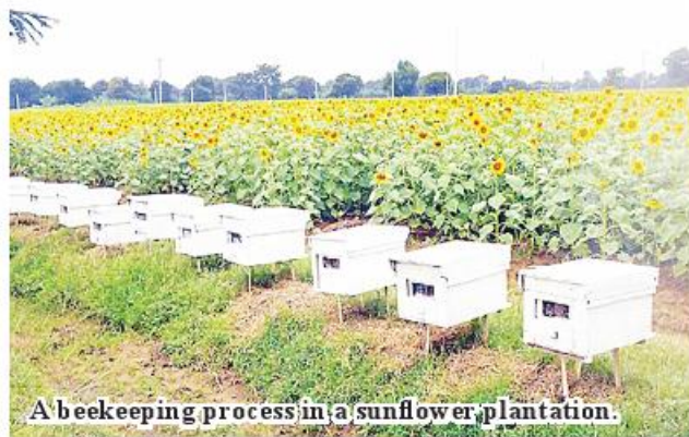
A beekeeping process in a sunflower plantation.

Some 200,000 beehives were operated in 2022-23 financial year, compared to more than 200,000 in 2023-24 FY. So, these beehives produce 6,500 tons of honey in 2022-23. Myanmar produces some 3,500 tons of honey on a yearly basis to sell some volume to foreign markets to earn incomes. 336