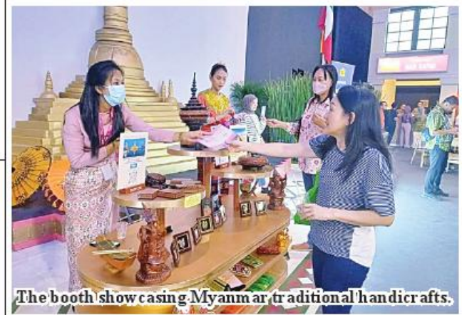
The booth showcasing Myanmar traditional handicrafts.

Yangon August 28 The Myanmar Embassy to Indonesia stated that Myanmar’s handicrafts, cultural products and lacquerwares were put on display at the ASEAN Fest 2023 held in Jakarta of Indonesia.