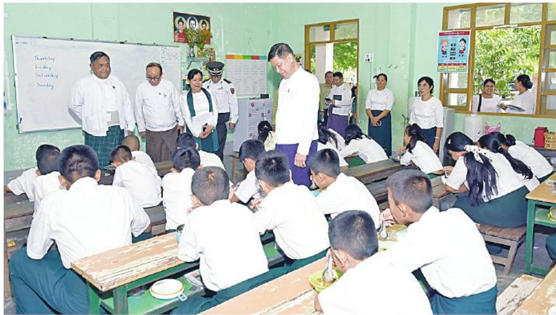
မန္တလေး၊ ဩဂုတ် ၂၀

မန္တလေးတိုင်းဒေသကြီး ဝန်ကြီးချုပ် ဦးမျိုးအောင်သည် တိုင်းဒေသကြီးဝန်ကြီးများဖြစ်သည့် သယံဇာတရေးရာဝန်ကြီး ဦးရွှေဝင်း၊ လူမှုရေးရာဝန်ကြီး ဦးအောင်မင်းနှင့် တာဝန်ရှိသူများလိုက်ပါပြီး ယနေ့ မွန်းလွဲပိုင်းက အောင်မြေသာစံမြို့နယ် ဥပုသ်တော်ရပ်ကွက်ရှိ အမှတ်(၁၇) အခြေခံပညာ အထက်တန်းကျောင်းခွဲရှိ ပေ ၁၄၀ + ပေ ၃၀ RCC သုံးထပ်စာသင်ကျောင်းဆောင်သစ် တည်ဆောက်ပြီးစီးမှု အခြေအနေကို သွားရောက်ကြည့်ရှု စစ်ဆေးသည်။