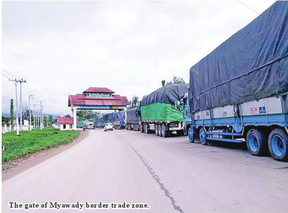
The gate of Myawady border trade zone.

Myawady August 28 The Ministry of Commerce stated that Myawady trade zone could handle more than US$610 million worth of trade value in July. Myanmar operates bor-