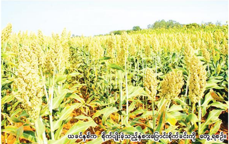
ယခင်နှစ်က စိုက်ပျိုးခဲ့သည့်နံစားပြောင်းစိုက်ခင်းကို တွေ့ရစဉ်။