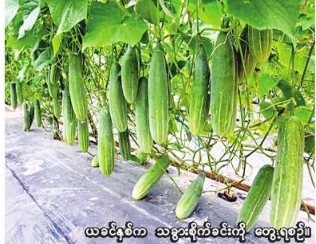
ယခင်နှစ်က သမားစိုက်ခင်းကို တွေ့ရစဉ်။

ကျုံပျော်မြို့နယ်တွင် ယခုနှစ် မိုးသီးနှံစိုက်ပျိုးရာသီ၌ စားဖို ဆောင်သီးနှံ ၃၀၀၃ ဧကတွင် ငရုတ်၊ မုန့်ညင်း၊ ချဉ်ပေါင်၊ ဂေါ်ဖီ၊ နံနံပင်၊ မုန့်လာ၊ ခရမ်း၊ သဘော်၊