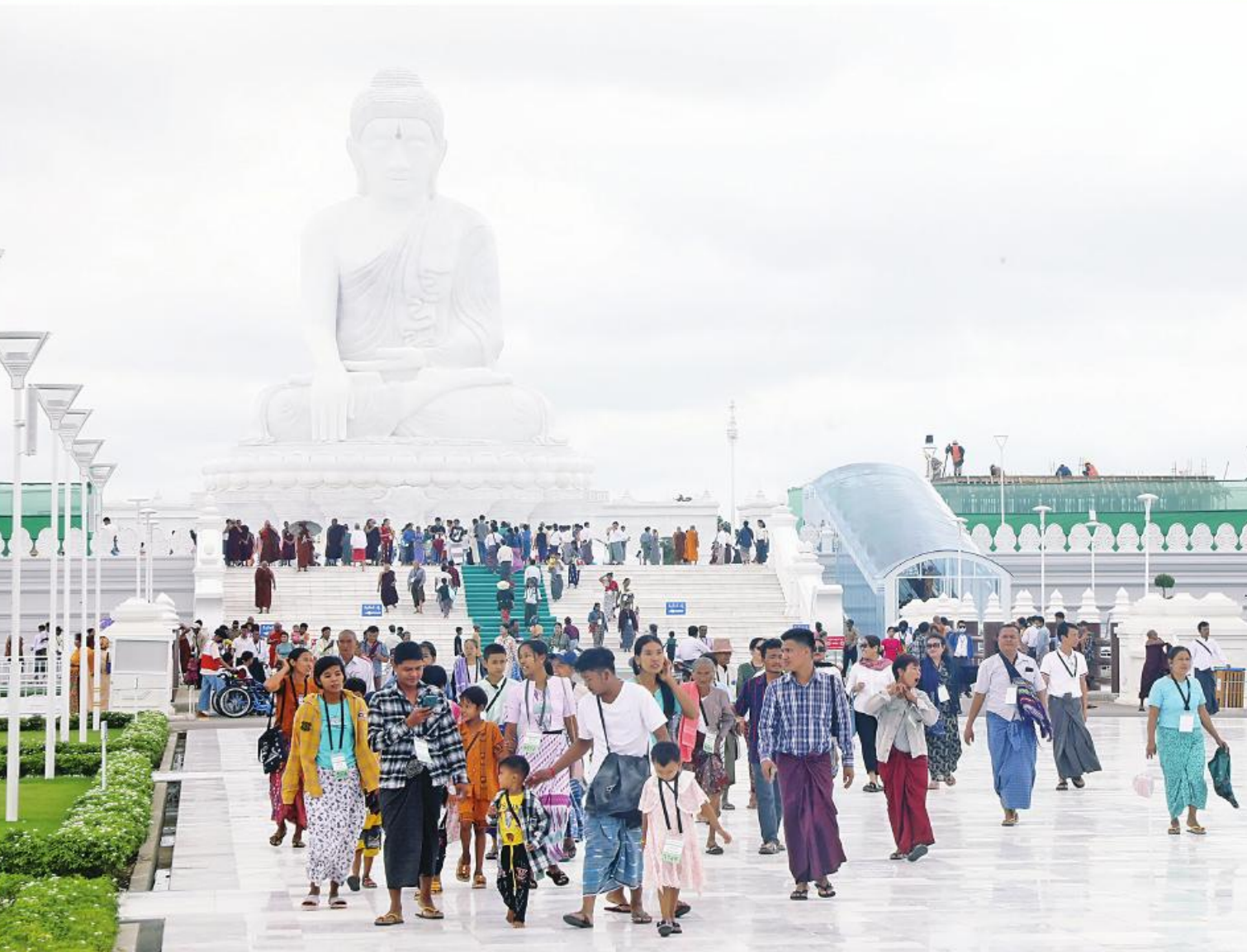
မာရဝိဇယဗုဒ္ဓရုပ်ပွားတော်မြတ်ကြီးသို့ အနယ်နယ်အရပ်ရပ်မှ လာရောက်ဖူးမြော်ကြည်ညိုကြသည့် ရဟန်းရှင်လူ ဘုရားဖူးပြည်သူများဖြင့် စည်ကားလျက်ရှိစဉ်။

နေပြည်တော် ဩဂုတ် ၂၈ - အနယ်နယ်အရပ်ရပ်မှ လာရောက် မြတ်ကြီး၊ ဂန္ဓကုဋီတိုက်များ၊ သုဓမ္မာ စိတ်အေးချမ်းသာစွာဖြင့် ဖူးမြော် ပြည်ထောင်စုနယ်မြေနေပြည်တော် ဖူးမြော်ကြည်ညိုကြသည့် ရဟန်းရှင်လူ မြတ်ကြီး၊ ဂန္ဓကုဋီတိုက်များ၊ သုဓမ္မာ စိတ်အေးချမ်းသာစွာဖြင့် ဖူးမြော် ဒက္ခိဏသီရိမြို့နယ်ရှိ ဗုဒ္ဓဥယျာဉ် ဝတ္ထု ကံတော်တွင် တည်ထားပူဇော်ထားရှိ လျက်ရှိသည်။ ယနေ့တွင်လည်း အနယ်နယ်အရပ် ရပ်မှ ရဟန်းရှင်လူ ပြည်သူများနှင့် ကျောက်ဆစ်ဗုဒ္ဓရုပ်ပွားတော်များအနက် ဘုရားဖူးပြည်သူများဖြင့် စည်ကား ကြီးသဒ္ဓါမိပတိခေါင်းလောင်းတော်နှင့် ကျောက်စာရုံစေတီများ အပါအဝင် ညက်တော်အမြင့်ဆုံး ဖြစ်တော်မူသော အခြားဘာသာရေးဆိုင်ရာ အဆောက် အအုံများ၊ တံတား၊ ဥယျာဉ်များကို မာရဝိဇယဗုဒ္ဓရုပ်ပွားတော် အဖွဲ့များ၊ တံတား၊ ဥယျာဉ်များကို စာမျက်နှာ ၁၈ ကော်လံ ၁၂၃