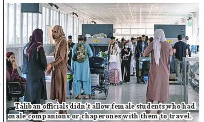
Taliban officials didn't allow female students who had male companions or chaperones with them to travel.