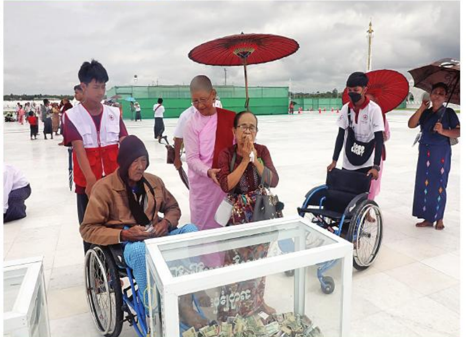
အနယ်နယ်အရပ်ရပ်မှ ရဟန်းရှင်လူ ဖြည့်သူများနှင့် ဘိုးဘွားများ အဂ္ဂိမိပတိသာသနာ့မိမိတော်ကြီးနှင့် ကျောက်စာရံစေတီများအပါအဝင် အခြားဘာသာရေးဆိုင်ရာအဆောက်အအုံများကို မိတ်အေးချမ်းသာစွာဖြင့် ဖူးမြော်ကြည့်ညို့လေ့လာခြင်း၊ တရားဘာဝနာပွားများခြင်း၊ အသင်းအဖွဲ့အလိုက်ဝတ်ရုတ်ပူဇော်ခြင်းများကို တွေ့မြင်ရစဉ်။

၂။ ရှေးမှအဆက် ဝန်ထမ်းများက လိုအပ်သည် ကျန်းမာရေး လမ်းလျှောက်ရန် အခက်အခဲဖြစ်သည် ကာ လိုအပ်သည်များ ကူညီဆောင်ရွက်ပေး များ အခမဲ့လာရောက်ဖူးမြော်ကြည့်ညို့နိုင် အဆိုပါ မာရဝိဇယဗုဒ္ဓရုပ်ပွားတော် စောင့်ရှောက်မှုလုပ်ငန်းများ ဆောင်ရွက် ဘိုးဘွားများအား အဆင်ပြေစွာဖြင့် လျက်ရှိသည်။ ရန် စက်တင်ဘာ ၃ရက်ထိ နံနက် ၆ နာရီ မြတ်ကြီးသို့ လာရောက်ဖူးမြော်ကြည့်ညို့ ပေးလျက်ရှိပြီး မြန်မာနိုင်ငံ ကြက်ခြေနီအဖွဲ့ ဘုရားဖူးမြော်ကြည့်ညို့နိုင်ရန် Wheel အဆိုပါ မာရဝိဇယဗုဒ္ဓရုပ်ပွားတော် မှ ည ၈နာရီအတွင်း ဖွင့်လှစ်ထားရှိကြောင်း ကြည့်ညို့ ဘိုးဘွားများအား ကျန်းမာရေး နှင့် မီးသတ်တပ်ဖွဲ့ဝင်များကလည်း Chair များဖြင့် လိုက်လံပို့ဆောင်ပေး မြတ်ကြီးအား ရဟန်းရှင်လူ အများပြည်သူ သတင်းရရှိသည်။