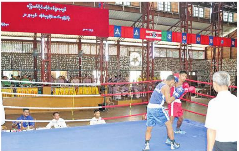
မြောက်ပိုင်းတိုင်းစစ်ဌာနချုပ် တိုင်းမှူးခိုင်း လက်ဝေပြိုင်ပွဲ ပထမနေ့ပွဲစဉ်ယှဉ်ပြိုင်ကစားစဉ်။