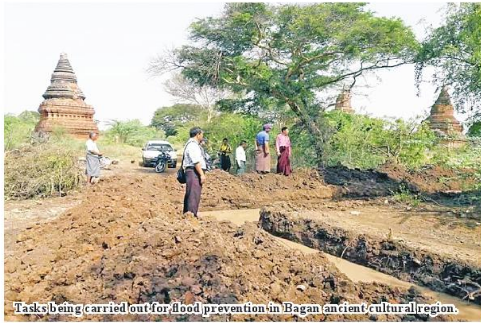
Tasks being carried out for flood prevention in Bagan ancient cultural region.

in which manpower cannot be deployed. Such work process must be mentioned in the State of Conversation-SOC report which is submitted once every two years.”