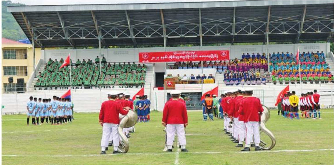
တြိဂံဒေသတိုင်းစစ်ဌာနချုပ် ၂၀၂၃ ခုနှစ် တိုင်းမှူးခိုင်း ဘောလုံးပြိုင်ပွဲဖွင့်ပွဲအခမ်းအနားကျင်းပစဉ်။

ကြသည်။ အဆိုပါဘောလုံးပြိုင်ပွဲကို တိုင်းစစ်ဌာနချုပ်ကွပ်ကဲမှုအောက် တပ်နယ်အသီးသီးမှ ပြိုင်ပွဲဝင်အသင်း ၁၄ သင်းဖြင့် စက်တင်ဘာ ၁၁ ရက်ထိ ယှဉ်ပြိုင်ကစားသွားမည်ဖြစ်ကြောင်း သတင်းရရှိသည်။