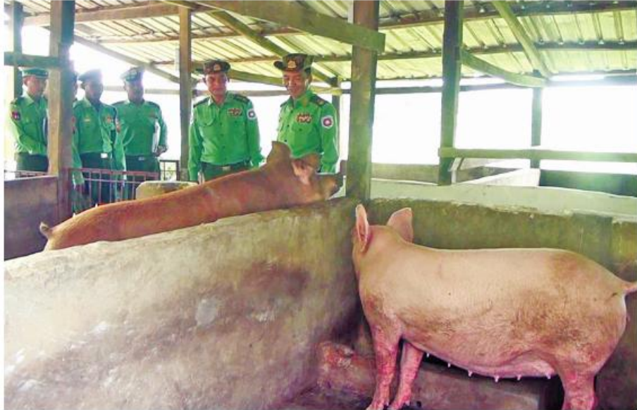
အနောက်ပိုင်း တိုင်းစစ်ဌာနချုပ် တိုင်းမှူး ဗိုလ်ချုပ်ထင်လတ်ဦး ရသေ့တောင်တပ်နယ်ရှိ နယ်မြေခံတပ်ရင်းများ၌ DYL ဝက်မွေးမြူရေးရုံများကို ကြည့်ရှုစစ်ဆေးစဉ်။

ရာသီသီးနှံစိုက်ခင်းများကို သွားရောက် ကြည့်ရှုစစ်ဆေးပြီး တာဝန်ရှိသူများနှင့် တွေ့ဆုံကာ ကုန်ထုတ်လုပ်မှုလုပ်ငန်းများ ရာနှုန်းပြည့်အောင်မြင်အောင် ဆောင်ရွက်နိုင်ရေး လိုအပ်သည်များ ပေါင်းစပ်ညှိနှိုင်းဆောင်ရွက်ပေးခဲ့ကြောင်း သတင်းရရှိသည်။