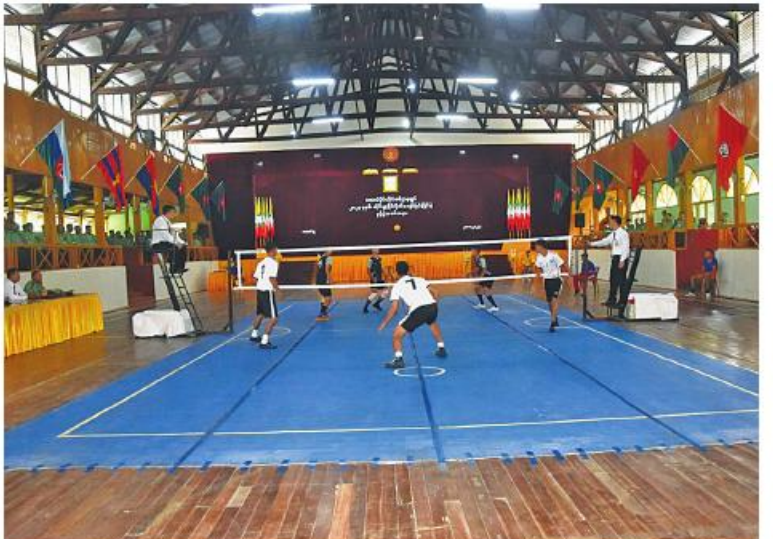
တောင်ပိုင်းတိုင်းစစ်ဌာနချုပ် တိုင်းမှူးခိုင်းပိုက်ကျော်ခြင်းပြိုင်ပွဲ ပထမနေ့ပွဲစဉ် ယှဉ်ပြိုင်ကစားစဉ်။

ဦးစွာ တိုင်းမှူးက အမှာစကားပြောကြားသည်။ ထို့နောက် တိုင်းမှူးနှင့်တက်ရောက်လာကြသူများက ပထမနေ့ပွဲစဉ်ယှဉ်ပြိုင်နေမှုများကို ကြည့်ရှုအားပေးကြသည်။ အဆိုပါပိုက်ကျော်ခြင်းပြိုင်ပွဲကို တိုင်းစစ်ဌာနချုပ် ကွပ်ကဲမှုအောက် တပ်နယ်အသီးသီးမှ ပြိုင်ပွဲဝင်အသင်း ခြောက်သင်းဖြင့် ဩဂုတ် ၃၁ ရက်ထိ ယှဉ်ပြိုင်ကစားသွားမည်ဖြစ်ကြောင်း သတင်းရရှိသည်။