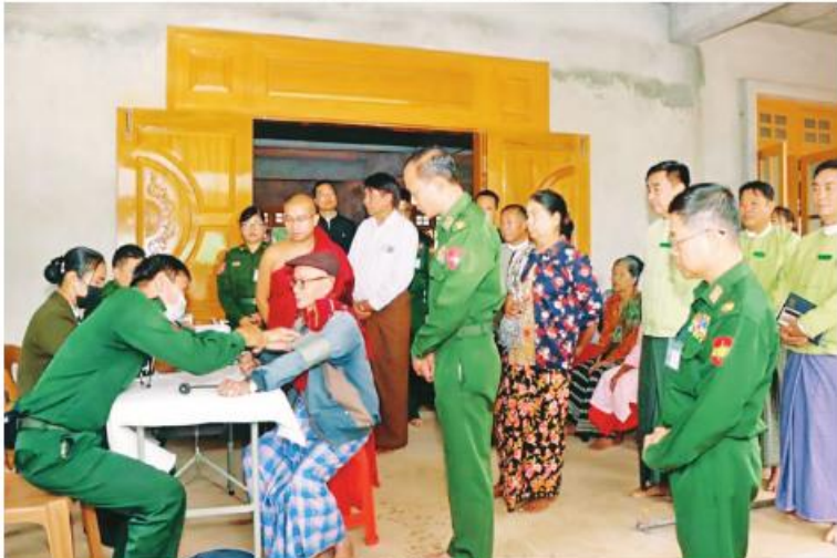
အလယ်ပိုင်းတိုင်းစစ်ဌာနချုပ်မှ နယ်မြေခံဆေးကုသရေးအဖွဲ့က ဒေသခံပြည်သူများအား ကျန်းမာရေးစောင့်ရှောက်မှုလုပ်ငန်းများ ဆောင်ရွက်ပေးနေမှုကို တာဝန်ရှိသူများက ကြည့်ရှုအားပေးစဉ်။

နေပြည်တော် ဩဂုတ် ၁၆ မန္တလေးတိုင်းဒေသကြီး ပြင်ဦးလွင်မြို့နယ် ရပ်ကွက်ကြီး(၃)ရှိ သံဃာတော်များ၊ သာသနာ့ဦးစီးဌာနမှ သီလရှင်များနှင့် ဒေသခံပြည်သူများကို ယနေ့နံနက်ပိုင်းတွင်