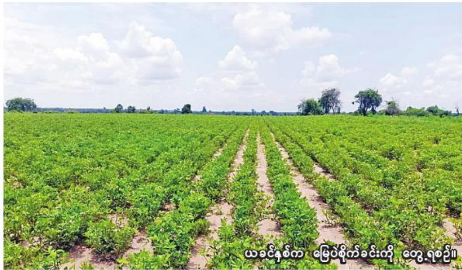
ယခုနှစ်က မြေပဲစိုက်ခင်းကို တွေ့ရစဉ်။

ကန့်ဘလူ ဩဂုတ် ၁၆ စစ်ကိုင်းတိုင်းဒေသကြီး ကန့်ဘလူခရိုင် ကန့်ဘလူမြို့နယ်တွင် ယခုနှစ် မိုးသီးနှံစိုက်ပျိုးရာသီ၌ မိုးမြေပဲ ၅၁၅၉၉ ဧက စိုက်ပျိုးပြီးစီးပြီဖြစ်ကြောင်း ကန့်ဘလူမြို့နယ် စိုက်ပျိုးရေးဦးစီးဌာနမှ သိရသည်။