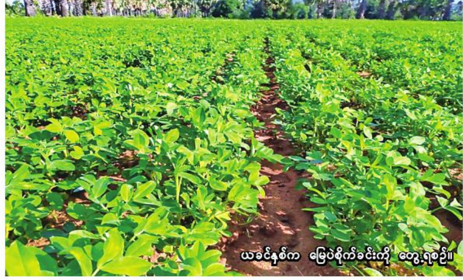
ယခင်နှစ်က မြေပဲစိုက်ခင်းကို တွေ့ရစဉ်။

ငရုတ်ကောင်းမြို့တွင် ယခုနှစ် ငရုတ်ကောင်းမြို့တွင် ယခုနှစ် မိုးသီးနှံစိုက်ပျိုးရာသီ၌ မိုးသီးနှံစိုက် ၁၀၅၄ ဧက စိုက်ပျိုးပြီးစီးပြီဖြစ်ကြောင်း ငရုတ်ကောင်းမြို့နယ်စိုက်ပျိုးရေးဦးစီးဌာန မြို့နယ်ဦးစီးမှူး ဦးထွန်းမျိုးသန့်က ပြောပြ၍ သိရသည်။