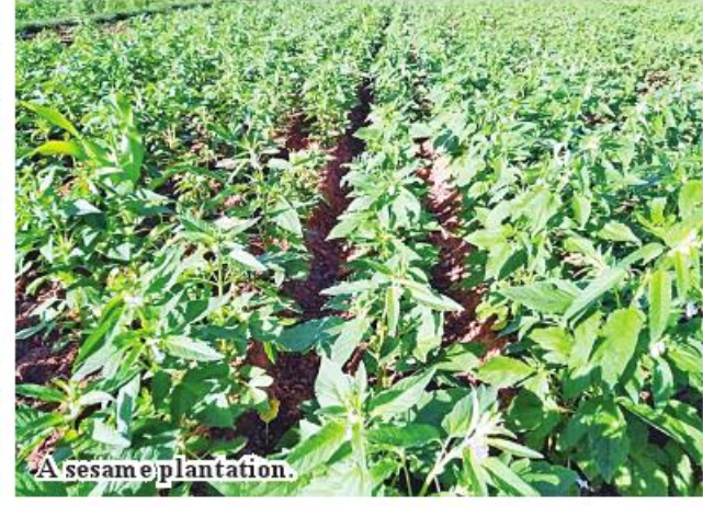
A sesame plantation.

measures and agricultural techniques to have high yield of crops. Po Htet (Minbu)