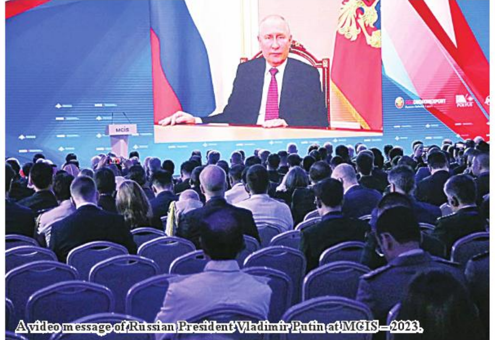
A video message of Russian President Vladimir Putin at MCIS-2023.