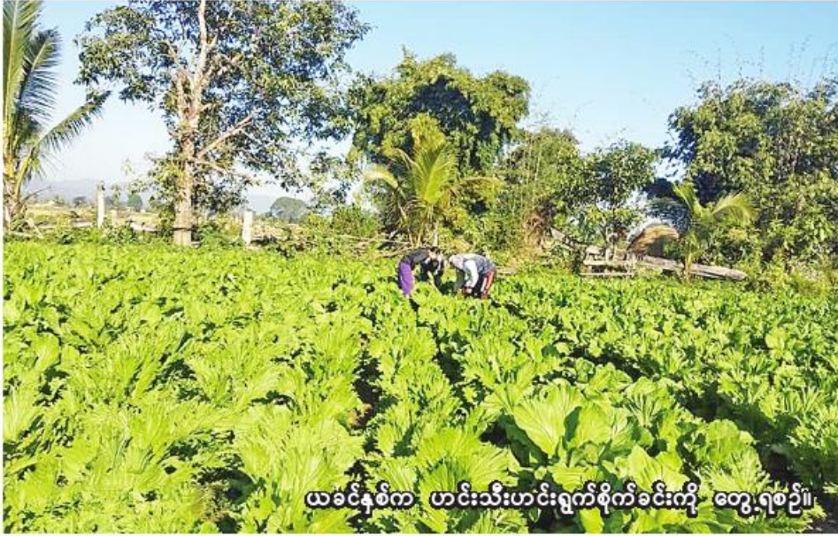
ယခင်နှစ်က ဟင်းသီးဟင်းရွက်စိုက်ခင်းကို တွေ့ရစဉ်။

နှစ် မိုးသီးနှံစိုက်ပျိုးရာသီ၌ ဟင်းသီးဟင်းရွက်စိုက်ပျိုးရန် မြို့နယ်အလိုက် လျာထားမှုအနေဖြင့် စစ်ကိုင်းမြို့နယ်တွင် ဧက ၂၄၃၃၀၊ မြင်းမူမြို့နယ်တွင် ဧက ၅၇၀၀ နှင့် မြောင်မြို့နယ်တွင် ဧက ၄၃၀၀ စုစုပေါင်း ဧက ၃၄၃၃၀ တို့ဖြစ်ကြောင်း သိရသည်။