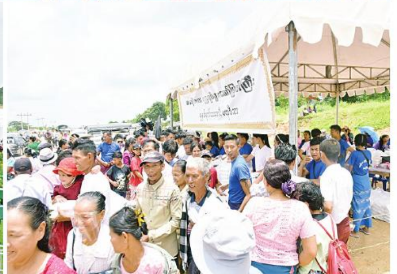
ပြည်ထောင်စုနယ်မြေ နေပြည်တော် ဒက္ခိဏသီရိမြို့နယ်ရှိ ဗုဒ္ဓဥယျာဉ်ဝတ္ထုကံတော်တွင် တည်ထားကိုးကွယ်အောင်မြင်ခဲ့သည့် ကမ္ဘာပေါ်ရှိ ထိုင်တော်မူကျောက်ဆစ်ဗုဒ္ဓရုပ်ပွားတော်များအနက် ဉာဏ်တော်အမြင့်ဆုံး ဖြစ်သည့် မာရဝိဇယဗုဒ္ဓရုပ်ပွားတော်မြတ်ကြီးအား အနယ်နယ်အရပ်ရပ်မှ လာရောက်ဖူးမြော်ကြည်ညိုကြသည့် ရဟန်းရှင်လူ ဘုရားဖူးလာပြည်သူများဖြင့် အထူးစည်ကားနေမှုကို တွေ့မြင်ရစဉ်။

နေပြည်တော် ဩဂုတ် ၁၆ ပြည်ထောင်စုနယ်မြေ နေပြည်တော် ဒက္ခိဏသီရိမြို့နယ်ရှိ ဗုဒ္ဓဥယျာဉ် ဝတ္ထုကံတော်တွင် တည်ထားပူဇော်အောင်မြင်ခဲ့သည့် ကမ္ဘာပေါ်ရှိ ထိုင်တော်မူကျောက်ဆစ်ဗုဒ္ဓရုပ်ပွားတော်များအနက် ဉာဏ်တော်အမြင့်ဆုံးဖြစ်သည့် မာရဝိဇယဗုဒ္ဓရုပ်ပွားတော်မြတ်ကြီးကို ယနေ့တွင်လည်း နံနက် ၆ နာရီမှစတင်၍ အများပြည်သူ ဖူးမြော်ကြည်ညိုခွင့်ပြုခဲ့ရာ အနယ်နယ်အရပ်ရပ်မှ လာရောက်ဖူးမြော်ကြည်ညိုကြသည့် ရဟန်းရှင်လူဘုရားဖူးပြည်သူများဖြင့် အထူးစည်ကားလျက်ရှိသည်။ ဦးစွာ တာဝန်ရှိသူများက ဘုရားဖူးပြည်သူများ ဘေးအန္တရာယ်ကင်းရှင်းစွာဖြင့် စိတ်လက်အေးချမ်းစွာ ဘုရားဖူးမြော်နိုင်ရေးအတွက် ဘုရားမုခ်ဦးများရွှေတွင် လုံခြုံရေးအရလိုအပ်သည့် စစ်ဆေးမှုများ ဆောင်ရွက်ပေးပြီး သံယာတော်များ၊ မသန်စွမ်းသူများနှင့် သက်ကြီးရွယ်အိုများ ဘုရားရင်ပြင်တော်သို့ သွားလာရေးလွယ်ကူစေရန်အတွက် မော်တော်ယာဉ်ငယ်များဖြင့် စနစ်တကျပို့ဆောင်ပေးသည်။ ထို့နောက် ဘုရားဖူးရဟန်းရှင်လူပြည်သူများသည် မာရဝိဇယဗုဒ္ဓရုပ်ပွားတော်မြတ်ကြီးအား ဖူးမြော်ကြည်ညိုကြပြီး စိတ်အေးချမ်းသာစွာဖြင့် တရားဘာဝနာပွားများခြင်း၊ အသင်းအဖွဲ့အလိုက် ဝတ်ရွတ်ပူဇော်ခြင်းတို့ကို ဆောင်ရွက်ကြသည်။ မာရဝိဇယ ဗုဒ္ဓရုပ်ပွားတော်မြတ်ကြီး တည်ထားပူဇော်ထားသည့် ဘုရားရင်ပြင်