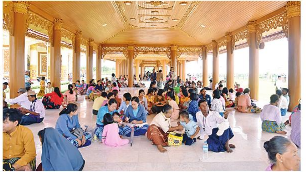
ပြည်ထောင်စုနယ်မြေ နေပြည်တော် ဒက္ခိဏဘက်ရှိ မြို့နယ်ရှိ ဗုဒ္ဓဗျာဉ်ဝတ္ထုကတော်တွင် တည်ထားကိုးကွယ်အောင်မြင်ခဲ့သည့် ကမ္ဘာပေါ်ရှိ ထိုင်တော်မူကျောက်ဆစ်ဗုဒ္ဓရုပ်ပွားတော်များအနက် ဣဏ်တော်အမြင့်ဆုံး ဖြစ်သည့် မာရဝိဇယဗုဒ္ဓရုပ်ပွားတော်မြတ်ကြီးအား အနယ်နယ်အရပ်ရပ်မှ လာရောက်ဖူးမြော်ကြည့်ညိကြသည့် ရဟန်းရှင်လူ ဘုရားဖူးလာပြည်သူများဖြင့် အထူးစည်ကားနေမှုကို တွေ့မြင်ရစဉ်။

စာမျက်နှာ ၁၈ မှ အဆက် တော်ဖြစ်ပါဝင်နိုင်ရေး မြန်မာနိုင်ငံသား USD နှုန်း တို့ဖြင့် သတ်မှတ်ကောက်ခံ Website ဖြစ်သည် mbiw.myannet. လေ့လာကြည့်ရှုနိုင်ကြောင်း နိဗ္ဗာန် လိုအပ်သည် ပြုပြင်ထိန်းသိမ်းခြင်း လူကြီး၊ ကလေး တစ်ဦးလျှင် ၁၀၀၀ သွားမည်ဖြစ်ပြီး အသေးစိတ်အား com၊ www.twitter.com၊ Maravijaya- အကျိုးမျှော်၍ နှိုးဆော်အသံပေးအပ် လုပ်ငန်းများဆောင်ရွက်ရာတွင် ကုသိုလ် ကျပ်နှင့် နိုင်ငံခြားသားတစ်ဦးလျှင် ၁၀ မာရဝိဇယ ဗုဒ္ဓရုပ်ပွားတော်မြတ်ကြီး၏ နှင့် t.me၊ Maravijaya တို့တွင် ဝင်ရောက် ပါသည်။