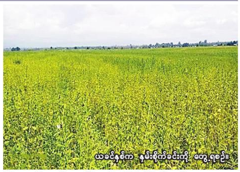
ယခင်နှစ်က - နှမ်းစိုက်ခင်းကို တွေ့ရစဉ်။

မှုအနေဖြင့် ကလေးမြို့နယ်တွင် ၂၆၇၀၅ ဧက၊ ကလေးဝမြို့နယ်တွင် ၃၃၄၆ ဧက၊ မင်းကင်းမြို့နယ်တွင် ၁၈၉၈၂ ဧက စုစုပေါင်း ၄၇၀၃၃ ဧကတို့ဖြစ်ကြောင်း သိရသည်။ ကလေးခရိုင်တွင် ယခုနှစ် မိုးသီးနှံစိုက်ပျိုးရာသီ၌ မိုးနှမ်းစိုက်ပျိုးမှု တိုးချဲ့စိုက်ပျိုးနိုင်ရေး၊ GAPနည်းစနစ်များဖြင့် စိုက်ပျိုးနိုင်ရေး၊ မျိုးကောင်းမျိုးသန့်များ စိုက်ပျိုးနိုင်ရေး၊ အထွက်နှုန်းကောင်းမွန်သည်မျိုးများ စိုက်ပျိုးနိုင်ရေးအတွက် သက်ဆိုင်ရာမြို့နယ်စိုက်ပျိုးရေးဦးစီးဌာနက အသိပညာပေးလျက်ရှိကြောင်း သိရသည်။ GAPနည်းစနစ်ဖြင့် စိုက်ပျိုးထုတ်လုပ်သည့်သီးနှံများသည် အခြားစိုက်ပျိုးနည်းစနစ်များဖြင့် စိုက်ပျိုးထုတ်လုပ်ထားသည့်