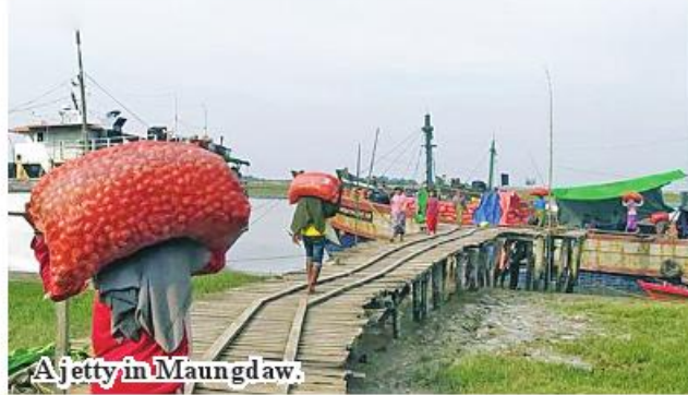
A jetty in Maungdaw.