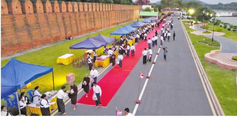
အလယ်ပိုင်းတိုင်းစစ်ဌာနချုပ် ဝါတွင်းကာလ သံဃာ့ဒါန ဆွမ်းလောင်းလှူပွဲကျင်းပစဉ်။

ဦးစွာ တိုင်းမှူးနှင့်တက်ရောက်လာကြသူများက မဟာမြတ်မုနိဘုရားကြီးအား ပန်း၊ ဆီမီး၊ ရေချမ်းနှင့်ဆွမ်းများ ဆက်ကပ်ပူဇော်ပြီး ဘုရားကြီးအား မျက်နှာတော်သစ်ရေသပ္ပာယ်ကာ ရွှေသင်္ကန်းနှင့် အလှူငွေများ ဆက်ကပ်လှူဒါန်းကြသည်။ ထို့နောက် တိုင်းမှူးနှင့် တက်ရောက်လာကြသူများက ကျိုင်းတုံမြို့ရှိ ဘုန်းတော်ကြီးကျောင်းများမှ သံဃာတော်များ၊ သာသနာ့ဦးစီးဌာနမှ ဆွမ်း၊ လှူဖွယ်ပစ္စည်းများနှင့် ဝတ္ထုငွေများ လောင်းလှူကြသည်။