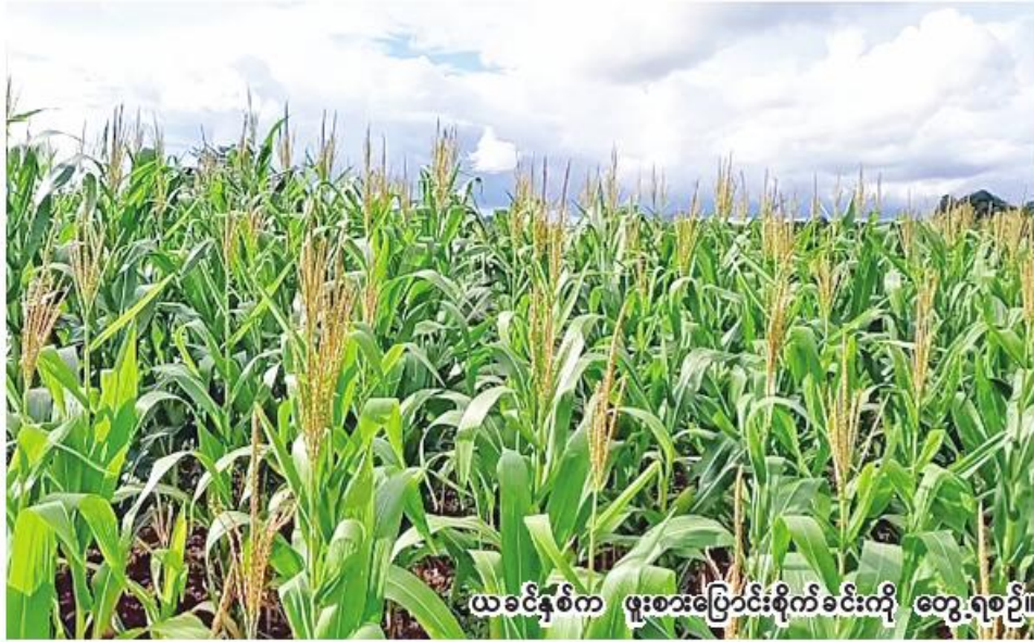
ယခင်နှစ်က ဖူးစားပြောင်းစိုက်ခင်းကို တွေ့ရစဉ်။

ပြောင်း ၁၀၀၄ ဧက၊ ဖူးစားပြောင်း ၂၈၀ ဧက၊ ဘုတလင်မြို့နယ်တွင် နံစားပြောင်း ၁၀၀၆၀၊ အရာတော်မြို့နယ်တွင် နံစားပြောင်း ၈၃၁၄ ဧက၊ ချောင်းဦးမြို့နယ်တွင် နံစားပြောင်း ၅၂၉၆ ဧက၊ အစေ့ထုတ်ပြောင်း ၃၁ ဧက၊ ဖူးစားပြောင်း ၉၆၄ ဧက စုစုပေါင်း ၃၉၃၃၇ ဧကဖြစ်ကြောင်းသိရသည်။ မုံရွာခရိုင်တွင် ယခုနှစ် ပြောင်း စိုက်ပျိုးသူများကို သက်ဆိုင်ရာ မြို့နယ် စိုက်ပျိုးရေးဦးစီးဌာနက သင်တန်းပေးခြင်း၊ ကွင်းသရုပ်ပြပွဲများဆောင်ရွက်ခြင်း၊ ဖောင်မြှောင်တောင်ပိုး ကြိုတင်ကာကွယ်ရေး အသိပညာပေးခြင်း လုပ်ငန်းများ ဆောင်ရွက်နေကြောင်း သိရသည်။ ထို့ပြင် ယခုနှစ် ဆောင်းသီးနှံ စိုက်ပျိုးရာသီ၌လည်း မုံရွာခရိုင်တွင် ပြောင်းစိုက်ပျိုးရန် မြို့နယ်အလိုက် လျာထားမှုအနေဖြင့် မုံရွာမြို့နယ်တွင် အစေ့ထုတ်ပြောင်း ၁၀၉၆ ဧက၊ ဖူးစားပြောင်း ၇၉၃၃ ဧက၊ ဘုတလင်မြို့နယ်တွင် ဖူးစားပြောင်း ၂၉၄၂ ဧက၊ အရာတော်မြို့နယ်တွင် ဖူးစားပြောင်း ၄၅၂၆ ဧကနှင့် ချောင်းဦးမြို့နယ်တွင် အစေ့ထုတ်ပြောင်း ၆၉ ဧက၊ ဖူးစားပြောင်း ၃၂၂၇ ဧက စုစုပေါင်း ၁၉၇၉၃ ဧကဖြစ်ကြောင်း သိရသည်။ (၂၀၆)