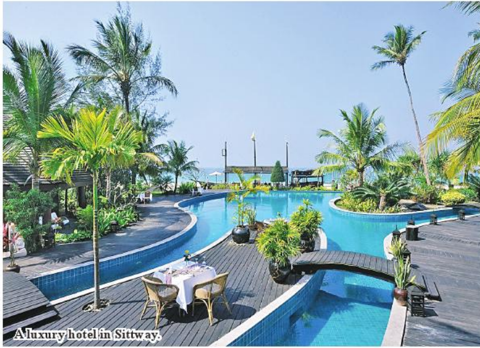
A luxury hotel in Sittway.

Sittway August 16 The Rakhine State Directorate of Hotels and Tourism stated that more than 70 hotels and lodges are being operated to give services to the guests in Rakhine State in the post-Mocha period. Rakhine State is endowed with the most famous Ngapali beach and MraukU cultural heritage area.