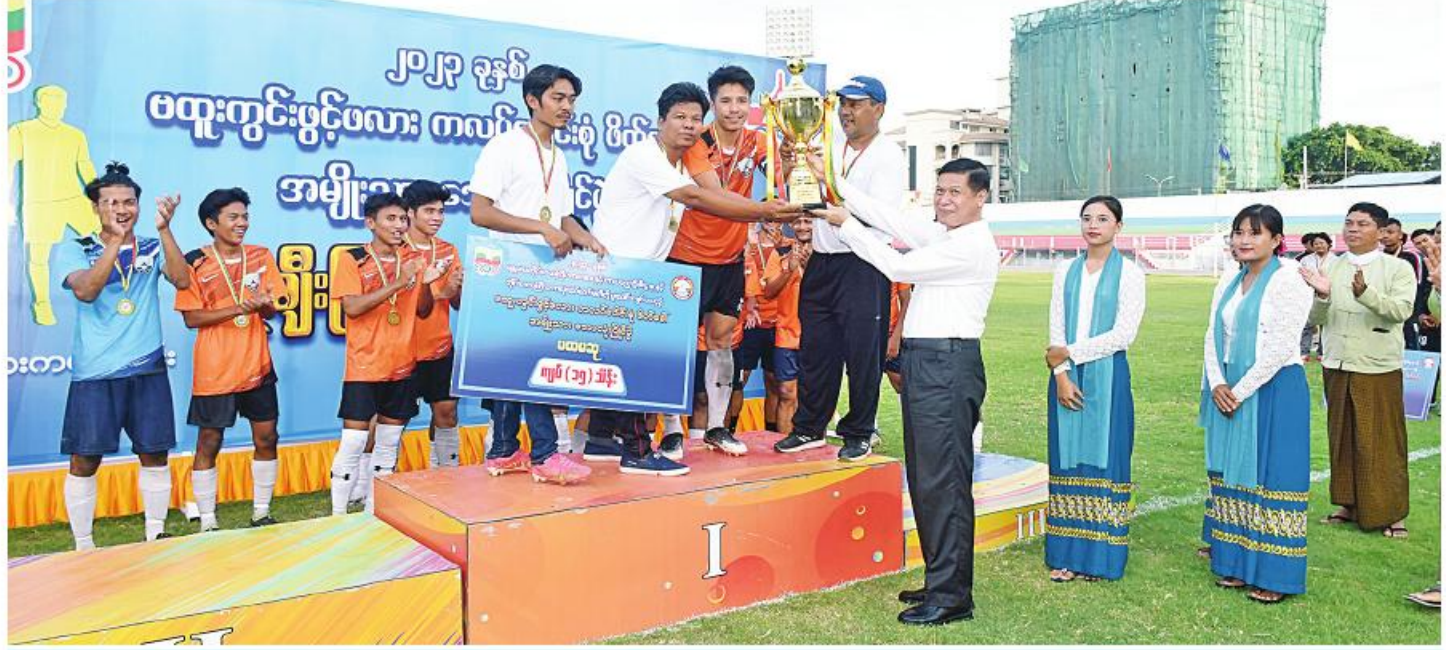
မန္တလေးတိုင်းဒေသကြီးဝန်ကြီးချုပ် ဦးမျိုးအောင် ၂၀၂၃ ခုနှစ် ဗထူးကွင်းဖွင့်ဖလား ကလပ်ပေါင်းစုံ ဖိတ်ခေါ်အမျိုးသားဘောလုံးပြိုင်ပွဲတွင် ပထမဆုံး မန္တလေးအသင်းကို တံခွန်စိုက်ဖလားနှင့် ငွေသားဆု ပေးအပ်ချီးမြှင့်စဉ်။

နေပြည်တော်၊ ဩဂုတ် ၁၆ - ချမ်းအေးသာစံမြို့နယ်ရှိ ဗထူးအားကစားကွင်း၌ ဆိုင်ရာများ၊ တိုင်းဒေသကြီးဘောလုံးဆက်ဆံရေး ဦးစီးဌာနမှ ဗထူးကွင်းဖွင့်ဖလား ကလပ်ပေါင်းစုံ ဖိတ်ခေါ်အမျိုးသားဘောလုံးပြိုင်ပွဲ ဗိုလ်လုပွဲနှင့် ဆုချီးမြှင့်ပွဲကျင်းပခဲ့သည်။ မန္တလေးတိုင်းဒေသကြီးဝန်ကြီးချုပ် မတီမှ တာဝန်ရှိသူများ၊ ပြိုင်ပွဲဝင်ကလပ်အသင်းများမှ အုပ်ချုပ်သူများနှင့် အားကစားသမားများ တက်ရောက်ခဲ့သည်။