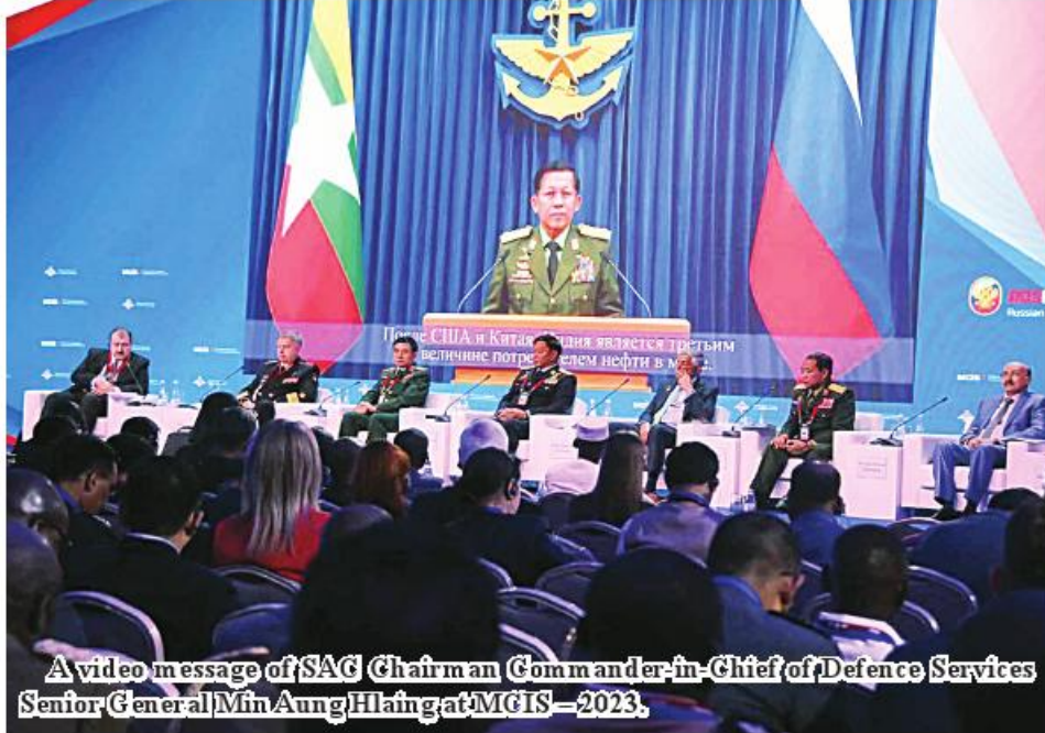
A video message of SAC Chairman (Commander-in-Chief of Defence Services) Senior General Min Aung Hlaing at MCIS-2023.