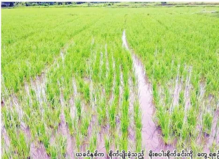
ယခင်နှစ်က စိုက်ပျိုးခဲ့သည့် မိုးစပါးစိုက်ခင်းကို တွေ့ရစဉ်။

ယင်းမာပင်ခရိုင်တွင် ပြီးခဲ့သည့်နှစ် မိုးသီးနှံစိုက်ပျိုးရာသီ၌ မိုးစပါးကို ၂၀၂၂ ခုနှစ် မေလမှ စက်တင်ဘာလထိ စိုက်ပျိုးခဲ့ရာ ၁၀၀၉၃၅ ဧကစိုက်ပျိုးနိုင်ခဲ့ကြောင်း သိရသည်။ ထို့ပြင် ယခုနှစ် နွေသီးနှံစိုက်ပျိုးရာသီတွင် ယင်းမာပင်ခရိုင်၌ နွေစပါး ၂၄၉၅ ဧက စိုက်ပျိုးရန် လျာထားပြီး ယခုနှစ် ဖေဖော်ဝါရီလမှ ဧပြီလထိစိုက်ပျိုးခဲ့ရာ နွေစပါး ၁၀၇၁ ဧက စိုက်ပျိုးနိုင်ခဲ့ကြောင်း သိရသည်။ (၂၀၆)