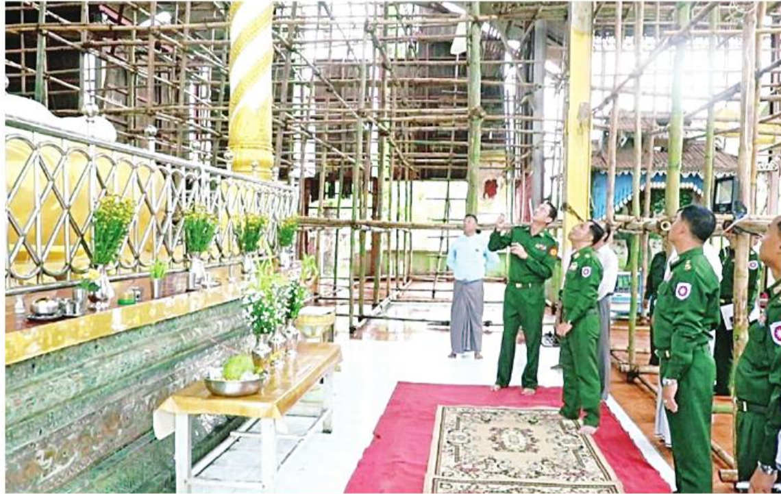
အနောက်ပိုင်းတိုင်းစစ်ဌာနချုပ် တိုင်းမှူး ဗိုလ်ချုပ်ထင်လတ်ဦး ရှေးဟောင်းသမိုင်းဝင် ဦးရဲကျော်သူကျောင်းတိုက်နှင့် သကျမုန့်ဘုရားသိမ်တော်ကြီး ရှေးမူမပျက်ပြန်လည်ပြုပြင်နေမှုကို ကြည့်ရှုစစ်ဆေးစဉ်။

နေပြည်တော် ဩဂုတ် ၁၆ မင်းအောင်လှိုင် ၂၀၂၃ ခုနှစ် ဇူလိုင် ၁၁ ခတ်မှုကြောင့် ထိခိုက်ပျက်စီးမှုများဖြစ်ပေါ် ရခိုင်ပြည်နယ် စစ်တွေမြို့ ရှေးဟောင်းသမိုင်းဝင် ဦးရဲကျော်သူကျောင်းတိုက် ပင်မကျောင်း