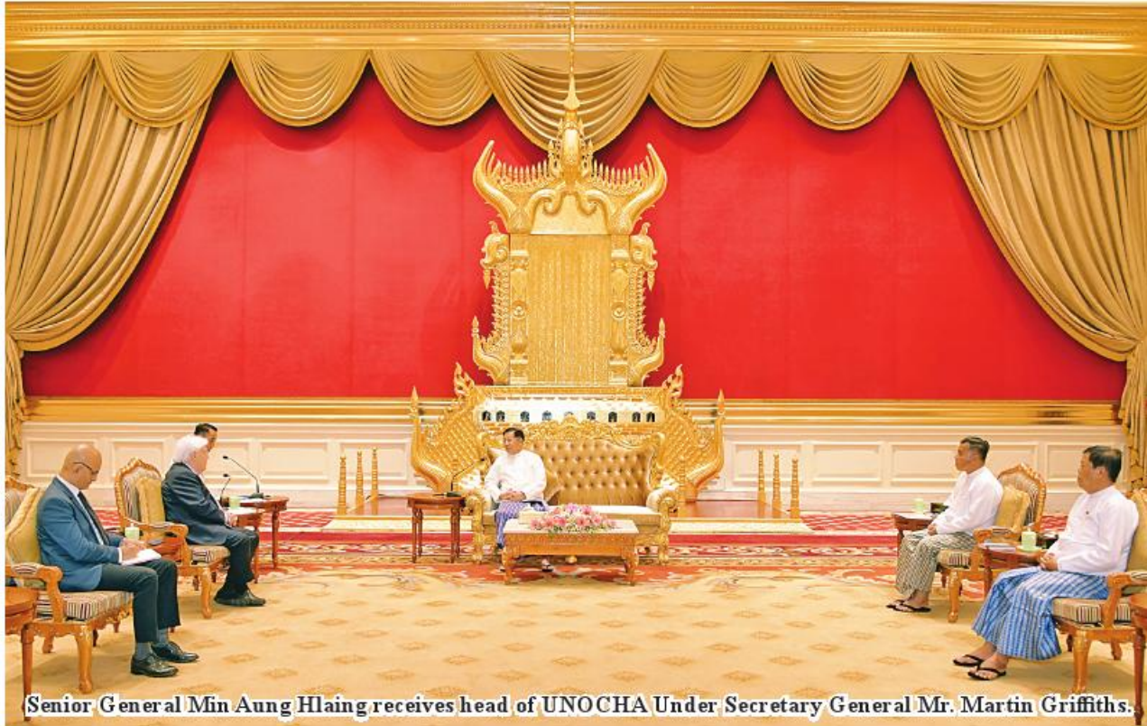
Senior General Min Aung Hlaing receives head of UNOCHA Under Secretary General Mr. Martin Griffiths.

Nay Pyi Taw August 15 Under Secretary General of Humanitarian Affairs and Emergency Relief Co-ordination of the United Nations Office for the Co-