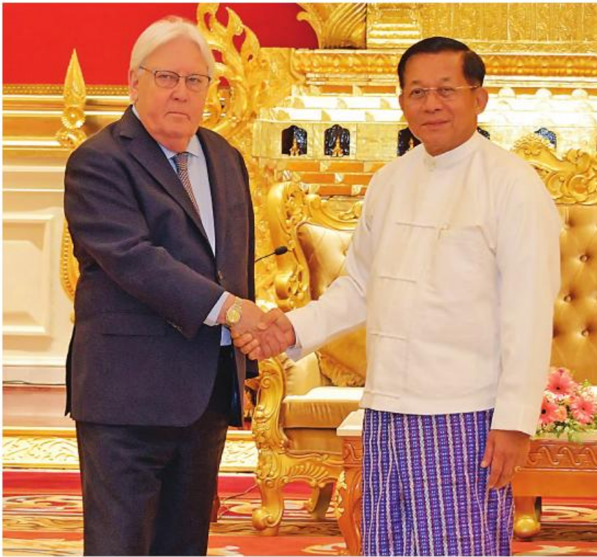
နိုင်ငံတော်စီမံအုပ်ချုပ်ရေး ကောင်စီဥက္ကဋ္ဌ နိုင်ငံတော်ဝန်ကြီးချုပ် ဝိုင်းအောင်လှိုင်နှင့် ကုလသမဂ္ဂလူသားချင်း စာနာထောက်ထားမှု ဆိုင်ရာနှင့် အရေးပေါ် ကယ်ဆယ်ရေးဆိုင်ရာ ညှိနှိုင်းရေးမှူးနှင့် ကုလသမဂ္ဂလူသားချင်း စာနာထောက်ထားမှုဆိုင်ရာ ညှိနှိုင်းရေးမှူး (UNOCHA) ၏ အကြီးအကဲဖြစ်သူ Under Secretary General Mr. Martin Griffiths တို့ ရင်းရင်းနှီးနှီး နှုတ်ဆက်စဉ်။

၂၅ ရေ.ရုံးမှအဆက် သံတမန်ဆောင် ဧည့်ခန်းမ၌ လာရောက် တွေ့ဆုံသည်။ အဆိုပါတွေ့ဆုံပွဲသို့ နိုင်ငံတော်စီမံ ဝန်ကြီးချုပ်နှင့်အတူ ကောင်စီတွဲဖက် အုပ်ချုပ်ရေးကောင်စီဥက္ကဋ္ဌ နိုင်ငံတော်