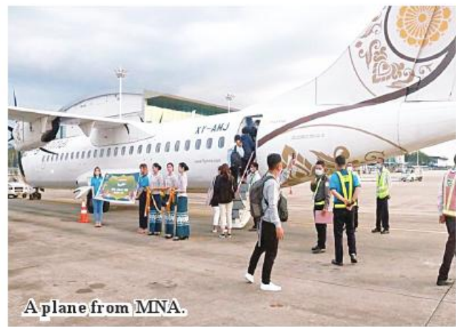
A plane from MNA.

tung, Kalay, Nay Pyi Taw, Yangon, Myitkyina, Putao and other major cities. 184