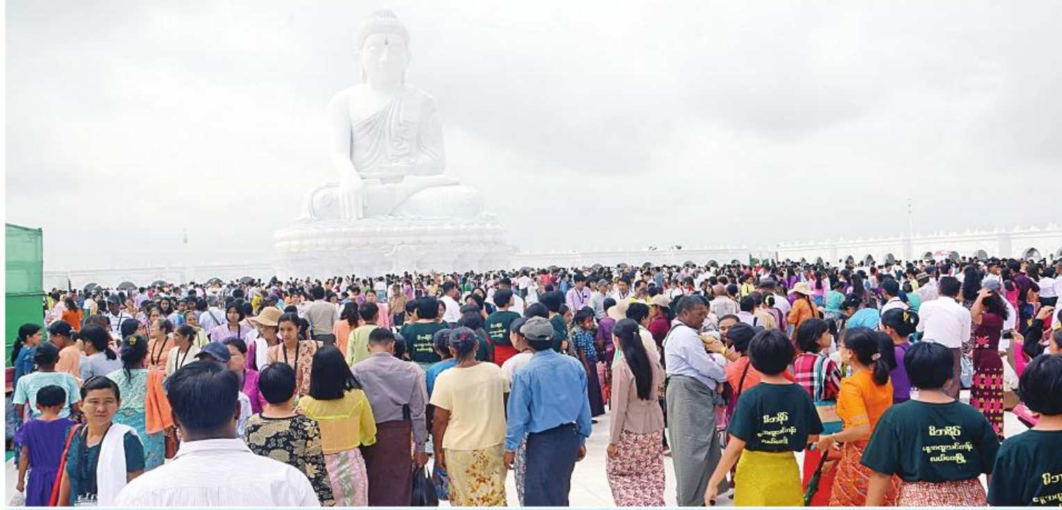
ကမ္ဘာပေါ်ရှိ ထိုင်တော်မူကျောက်ဆစ်ဗုဒ္ဓရုပ်ပွားတော်များအနက် ဉာဏ်တော်အမြင့်ဆုံးဖြစ်သည့် မာရဝိဇယဗုဒ္ဓရုပ်ပွားတော်မြတ်ကြီးအား အနယ်နယ်အရပ်ရပ်မှ လာရောက်ဖူးမြော်ကြည်ညိုကြသည့် ရဟန်းရှင်လူဘုရားဖူးလာပြည်သူများဖြင့် အထူးစည်ကားလျက်ရှိစဉ်။

နေပြည်တော် ဩဂုတ် ၁၅ သည့် ကမ္ဘာပေါ်ရှိ ထိုင်တော်မူကျောက်ဆစ်ဗုဒ္ဓရုပ်ပွားတော်များအနက် ဉာဏ်တော်အမြင့်ဆုံးဖြစ်သည့် မာရဝိဇယဗုဒ္ဓရုပ်ပွားတော်မြတ်ကြီးအား ယနေ့တွင် နံနက် ၆ နာရီမှစတင်၍ အများ ဘုရားဖူးပြည်သူများဖြင့် အထူးစည်ကား လှည့်လည် ဖူးမြော်ကြည်ညိုခွင့်ပြုခဲ့ရာ လျက်ရှိသည်။ ဦးစွာ တာဝန်ရှိသူများက စာမျက်နှာ ၁၆ ကော်လံ ၁ ☆