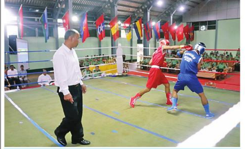
အရှေ့ပိုင်းတိုင်းစစ်ဌာနချုပ် တိုင်းမှူးဒိုင်း လက်ဝှေ့ပြိုင်ပွဲ ဝိတ်တန်းအလိုက် ဝိုင်းလှည့် ယှဉ်ပြိုင်ကစားစဉ်။

နေပြည်တော် ဩဂုတ် ၁၅ - အရှေ့ပိုင်းတိုင်းစစ်ဌာနချုပ်၏ ၂၀၂၃ ခုနှစ် တိုင်းမှူးဒိုင်း လက်ဝှေ့ပြိုင်ပွဲ ဝိုင်းလှည့်နှင့်ဆုပေးပွဲကို ဩဂုတ် ၁၄ ရက်ညနေပိုင်းတွင် နယ်မြေခံသင်တန်းကျောင်းဝင်း အားကစားခန်းမ၌ ပြုလုပ်ရာ တိုင်းစစ်ဌာနချုပ်မှ တာဝန်ရှိသူများ၊ အရာရှိ၊ စစ်သည်၊ မိသားစုဝင်များ၊ ဒိုင်အဖွဲ့ဝင်များနှင့် ပြိုင်ပွဲဝင် အားကစားသမားများ တက်ရောက်ကြသည်။ ဦးစွာ တက်ရောက်လာကြသူများက ဝိတ်တန်းအလိုက်လက်ဝှေ့ပြိုင်ပွဲ ဝိုင်းလှည့်ပွဲစဉ် ယှဉ်ပြိုင်နေမှုများကို ကြည့်ရှုအားပေးကြသည်။ ထို့နောက် ဆုပေးပွဲကို တစ်ဦးချင်းဆုရရှိကြသူများ၊ ဒိုင်အဖွဲ့ဝင်များနှင့် ဒိုင်းဆုရရှိသော ဟိုပုံးတပ်နယ် အသင်းတို့ကို တာဝန်ရှိသူများက ဒိုင်းဆုနှင့် ဂုဏ်ပြုဆုငွေများ အသီးသီးပေးအပ်ချီးမြှင့်သည်။ အဆိုပါ တိုင်းမှူးဒိုင်း လက်ဝှေ့ပြိုင်ပွဲကို တိုင်းစစ်ဌာနချုပ် ကွပ်ကဲမှုအောက် တပ်ရင်း၊ တပ်ဖွဲ့များမှ ပြိုင်ပွဲဝင်အသင်း ရှစ်သင်းဖြင့် ဩဂုတ် ၇ ရက်မှ ဩဂုတ် ၁၄ ရက်ထိ ကျင်းပပြုလုပ်ခဲ့ခြင်းဖြစ်ကြောင်း သတင်းရရှိသည်။