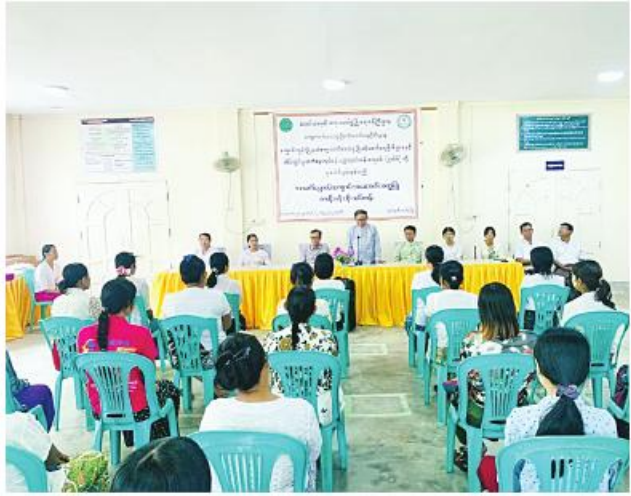
► စာမျက်နှာ ၂၄မှအဆက်

ကျောင်းကုန်း၊ ဩဂုတ် ၁၅ ဧရာဝတီတိုင်းဒေသကြီး ကျွဲ (ပုသိမ်)တို့ ပူးပေါင်းဖွင့်လှစ်သော ပျော်ခရိုင် ကျောင်းကုန်းမြို့နယ် အသက်မွေးဝမ်းကျောင်းအထောက်အကူပြု ဇာတိပန်းထိုးသင်တန်း ဦးစီးဌာနနှင့် အိမ်ထွင်းမှုသက်မွေး ဖွင့်ပွဲကို ဩဂုတ် ၁၄ ရက် နံနက်