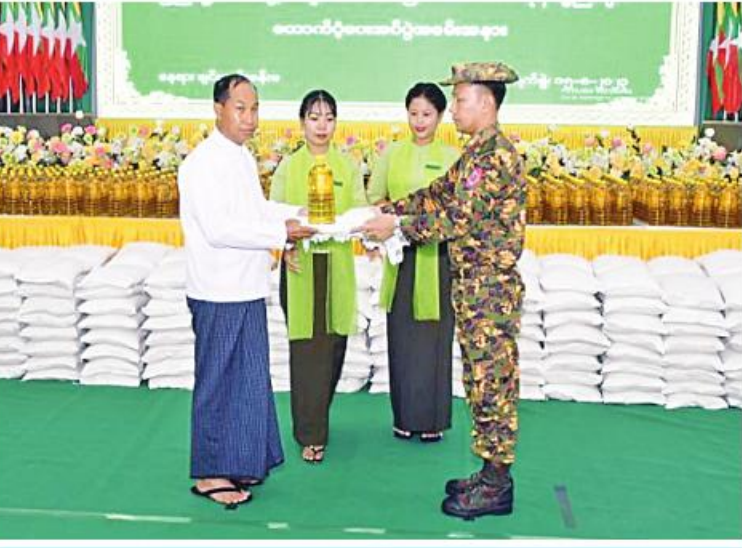
စစ်ကိုင်းတိုင်းဒေသကြီးဝန်ကြီးချုပ် ဦးမြတ်ကျော် လုံခြုံရေးတပ်ဖွဲ့ဝင်များကို စားသောက်ဖွယ်ရာများ ချီးမြှင့်ပေးအပ်စဉ်။

နေပြည်တော်၊ ဩဂုတ် ၁၅ - စစ်ကိုင်းတိုင်းဒေသကြီးအတွင်း နယ်မြေ လုံခြုံရေးနှင့် နယ်မြေတည်ငြိမ်အေးချမ်းရေး တာဝန်ထမ်းဆောင်နေသည့် လုံခြုံရေး