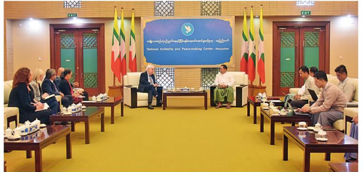
လူသားချင်း စာနာထောက်ထားမှုဆိုင်ရာ အကူအညီပေးရေးကိစ္စရပ်များ၊ မြန်မာနိုင်ငံ၏ငြိမ်းချမ်းရေးလုပ်ငန်းစဉ်ဆိုင်ရာ ကိစ္စရပ်များနှင့် အရေးပေါ်ကယ်ဆယ်ရေးဆိုင်ရာကိစ္စရပ်များအပေါ် အမြင်ချင်းဖလှယ်ဆွေးနွေးခဲ့ကြသည်။

နေပြည်တော်၊ ဩဂုတ် ၁၅ နိုင်ငံတော် စီမံအုပ်ချုပ်ရေးကောင်စီ အဖွဲ့ဝင် အမျိုးသားစည်းလုံးညီညွတ်ရေး နှင့် ငြိမ်းချမ်းရေးဖော်ဆောင်မှုညှိနှိုင်းရေး ကော်မတီဥက္ကဋ္ဌ ပြည်ထောင်စုဝန်ကြီး ခုတိယဗိုလ်ချုပ်ကြီးရာပြည့်သည် ကုလသမဂ္ဂ အဖွဲ့အစည်း၏တတိယအဆင့်ရှိ အဆင့်မြင့် အရာရှိကြီးနှင့် ကုလသမဂ္ဂလူသားချင်း စာနာထောက်ထားမှုဆိုင်ရာ ညှိနှိုင်းရေးမှူး (UNOCHA) ၏ အကြီးအကဲဖြစ်သူ ကုလသမဂ္ဂလူသားချင်းစာနာထောက်ထားမှု ဆိုင်ရာနှင့် အရေးပေါ်ကယ်ဆယ်ရေးဆိုင်ရာ ညှိနှိုင်းရေးမှူး Under Secretary General Mr. Martin Griffiths ဦးဆောင်သည့် ကိုယ်စားလှယ်အဖွဲ့ကို ယနေ့နံနက်ပိုင်းတွင် နေပြည်တော်ရှိ အမျိုးသားစည်းလုံးညီညွတ် ရေးနှင့် ငြိမ်းချမ်းရေးဖော်ဆောင်မှု