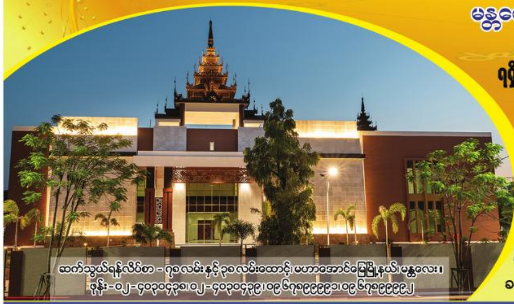
ဆက်သွယ်ရန်လိပ်စာ - ၇၈လမ်းနှင့် ၃၈လမ်းထောင့်၊ မဟာအောင်မြေမြို့နယ်၊ မန္တလေး။ ဖုန်း- ၀၂-၄၀၃၀၄၃၈၊ ၀၂-၄၀၃၀၄၃၉၊ ၀၉၆၇၈၉၉၉၁၊ ၀၉၆၇၈၉၉၉၂