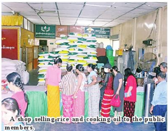
A shop selling rice and cooking oil to the public members.