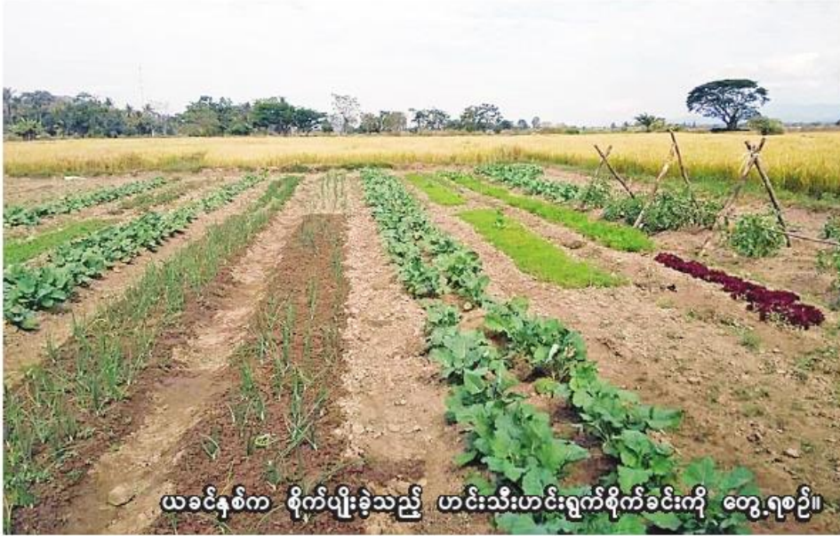
ယခုနှစ်က စိုက်ပျိုးခဲ့သည့် ဟင်းသီးဟင်းရွက်စိုက်ခင်းကို တွေ့ရစဉ်။