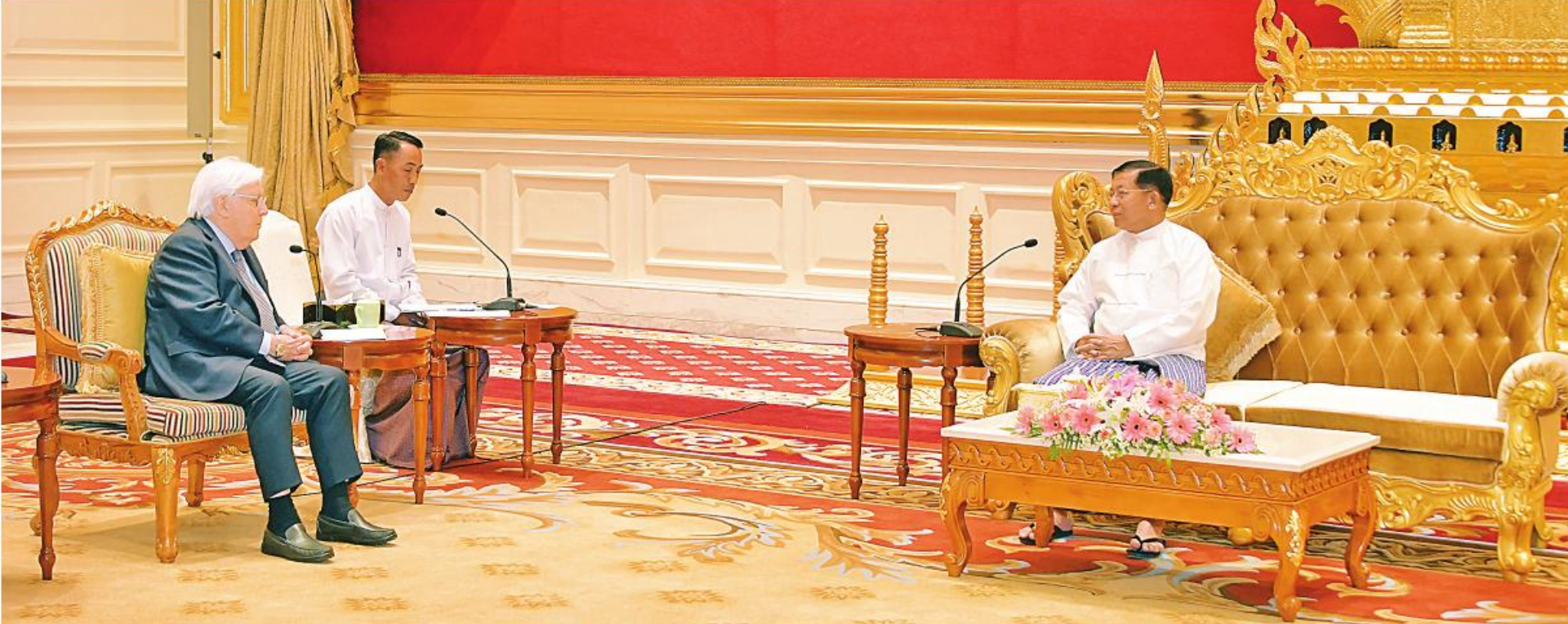
နိုင်ငံတော်စီမံအုပ်ချုပ်ရေးကောင်စီဥက္ကဋ္ဌ နိုင်ငံတော်ဝန်ကြီးချုပ် ဝိလ်ချပ်မှူးကြီးမင်းအောင်လှိုင်ထံ ကုလသမဂ္ဂလူသားချင်းစာနာထောက်ထားမှုဆိုင်ရာနှင့် အရေးပေါ်ကယ်ဆယ်ရေးဆိုင်ရာညှိနှိုင်းရေးမှူးနှင့် ကုလသမဂ္ဂလူသားချင်းစာနာထောက်ထားမှုဆိုင်ရာညှိနှိုင်းရေးရုံး(UNOCHA)၏ အကြီးအကဲဖြစ်သူ Under Secretary General Mr. Martin Griffiths ဦးဆောင်သော ကိုယ်စားလှယ်အဖွဲ့ လာရောက်တွေ့ဆုံခဲ့ပါ။

နေပြည်တော်၊ ဩဂုတ် ၁၅ ၊ ဝိလ်ချပ်မှူးကြီး မင်းအောင်လှိုင်ထံ ရေးဆိုင်ရာ ညှိနှိုင်းရေးမှူးနှင့် ကုလ အကြီးအကဲဖြစ်သူ Under Secretary ယနေ့မွန်းလွဲပိုင်းတွင် နေပြည်တော်ရှိ နိုင်ငံတော်စီမံအုပ်ချုပ်ရေးကောင်စီ ၊ ကုလသမဂ္ဂလူသားချင်းစာနာထောက် ထားမှုဆိုင်ရာနှင့် အရေးပေါ်ကယ်ဆယ် ဆိုင်ရာညှိနှိုင်းရေးရုံး(UNOCHA)၏ ဦးဆောင်သော ကိုယ်စားလှယ်အဖွဲ့က ရုံး စာမျက်နှာ ၁၈ ကော်လံ ၁၂၅