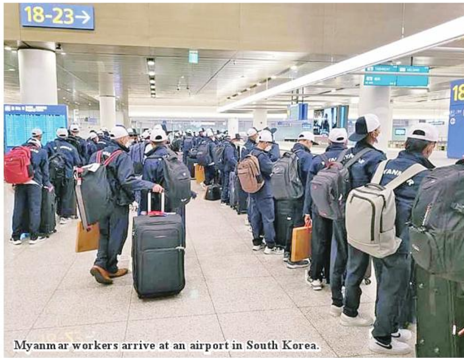
Myanmar workers arrive at an airport in South Korea.

Yangon August 15 The Ministry of Foreign Affairs stated that arrangements are being made to extend appointment of more Myanmar staff at the foreign workers support centres in the Republic of Korea in