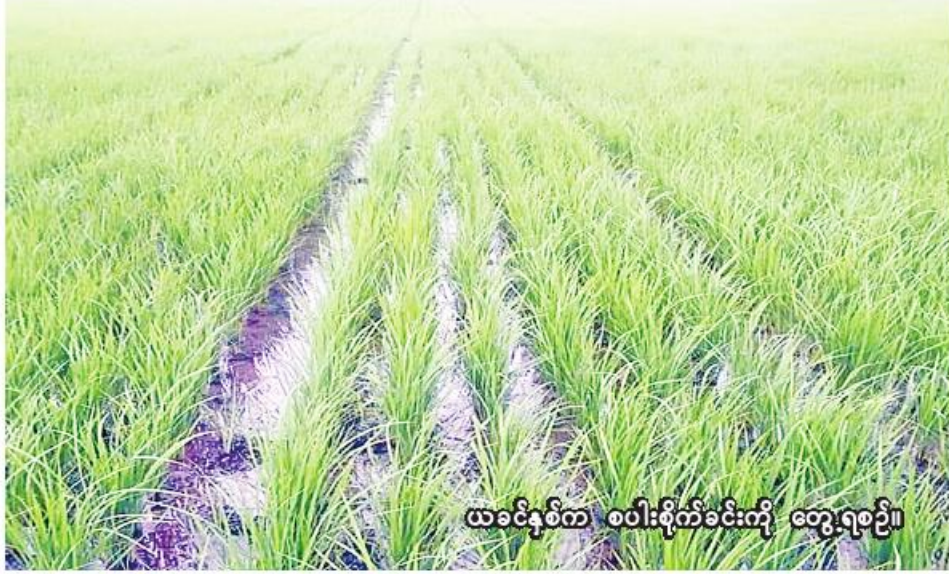
ယခင်နှစ်က စပါးစိုက်ခင်းကို တွေ့ရစဉ်။

ခရိုင်ဦးစီးမှူး ဒေါ်သီတာလွင်က ပြောပြသည်။