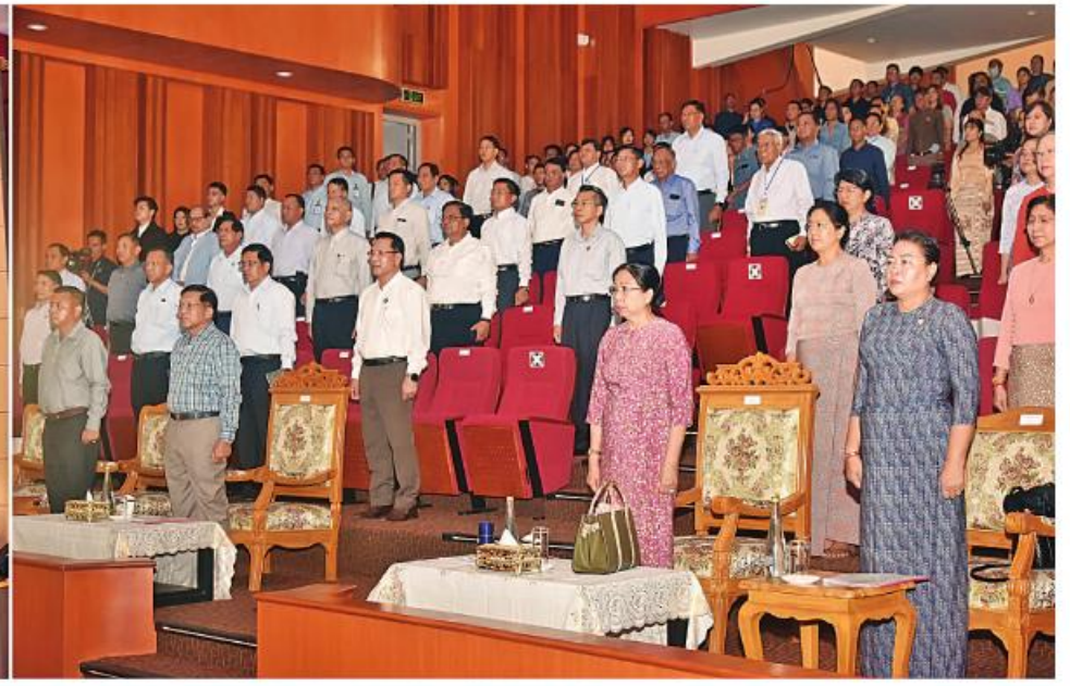
နိုင်ငံတော်သံစုံတီးဝိုင်းက နိုင်ငံတော်သီချင်းကိုတီးမှုတ်ရာ နိုင်ငံတော်စီမံအုပ်ချုပ်ရေးကောင်စီဥက္ကဋ္ဌ နိုင်ငံတော်ဝန်ကြီးချုပ် ဗိုလ်ချုပ်မှူးကြီးမင်းအောင်လှိုင်နှင့် ဧည့်သည်သည်များ၊ ဒေါ်ကြူကြူလှ၊ တက်ရောက်လာကြသူများက မတ်တတ်ရပ် အလေးပြုကြခြင်း။