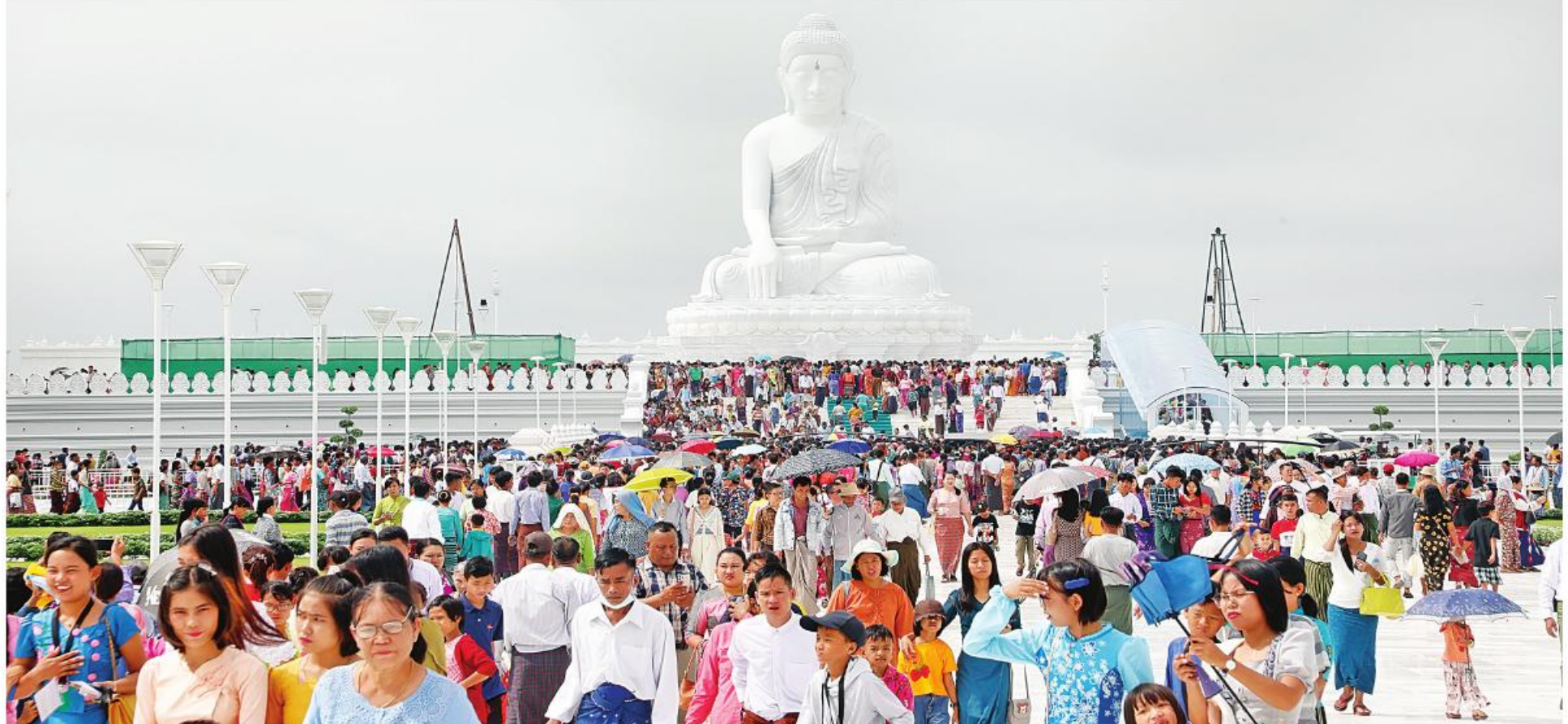
ကမ္ဘာပေါ်ရှိ ထိုင်တော်မူကျောက်ဆစ်ဗုဒ္ဓရုပ်ပွားတော်များအနက် ဉာဏ်တော်အမြင့်ဆုံးဖြစ်သည့် မာရဝိဇယဗုဒ္ဓရုပ်ပွားတော်မြတ်ကြီးအား အနယ်နယ်အရပ်ရပ်မှ လာရောက်ဖူးမြော်ကြည်ညိုကြသည့် ရဟန်းရှင်လူဘုရားဖူးလာပြည်သူများဖြင့် အထူးစည်ကားလျက်ရှိစဉ်။

နေပြည်တော် ဩဂုတ် ၁၃ တည်ထားပူဇော်အောင်မြင်ခဲ့သည့် ကမ္ဘာပေါ်ရှိ ရုပ်ပွားတော်မြတ်ကြီးအား ယနေ့ရုံးပိတ်ရက်တွင် လာရောက်ဖူးမြော်ကြည်ညိုကြသည့် ရဟန်း ပြည်ထောင်စုနယ်မြေ နေပြည်တော် ဒက္ခိဏ | ထိုင်တော်မူကျောက်ဆစ်ဗုဒ္ဓရုပ်ပွားတော်များအနက် | လည်း နံနက် ၆ နာရီမှစတင်၍ အများပြည်သူ | ရှင်လူဘုရားဖူးပြည်သူများဖြင့် အထူးစည်ကား သီရိမြို့နယ်ရှိ ဗုဒ္ဓဥယျာဉ်ဝတ္ထုကံတော်တွင် ဉာဏ်တော်အမြင့်ဆုံးဖြစ်သည့် မာရဝိဇယဗုဒ္ဓ ဖူးမြော်ကြည်ညိုခွင့်ပြုခဲ့ရာ အနယ်နယ်အရပ်ရပ်မှ လျက်ရှိသည်။ စာမျက်နှာ ၁၇ ကော်လံ ၄ ၂၃