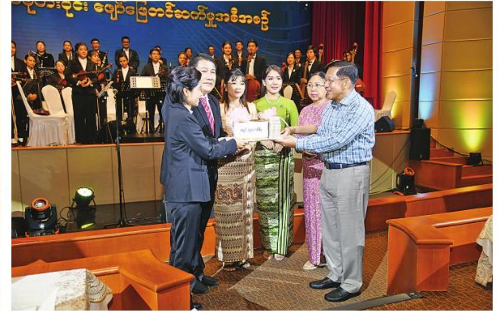
နိုင်ငံတော်စီမံအုပ်ချုပ်ရေးကောင်စီဥက္ကဋ္ဌ နိုင်ငံတော်ဝန်ကြီးချုပ် ဗိုလ်ချုပ်မှူးကြီးမင်းအောင်လှိုင်နှင့် ဧည့်သည်သည်များ၊ ဒေါ်ကြူကြူလှတို့ နိုင်ငံတော်သံစုံတီးဝိုင်းကို ဖျော်ဖြေရေးအဖွဲ့နှင့် ပြင်ပအဆိုရှင်များကို ဂုဏ်ပြုပေးခြင်းများ ပေးအပ်ချီးမြှင့်ခြင်း။