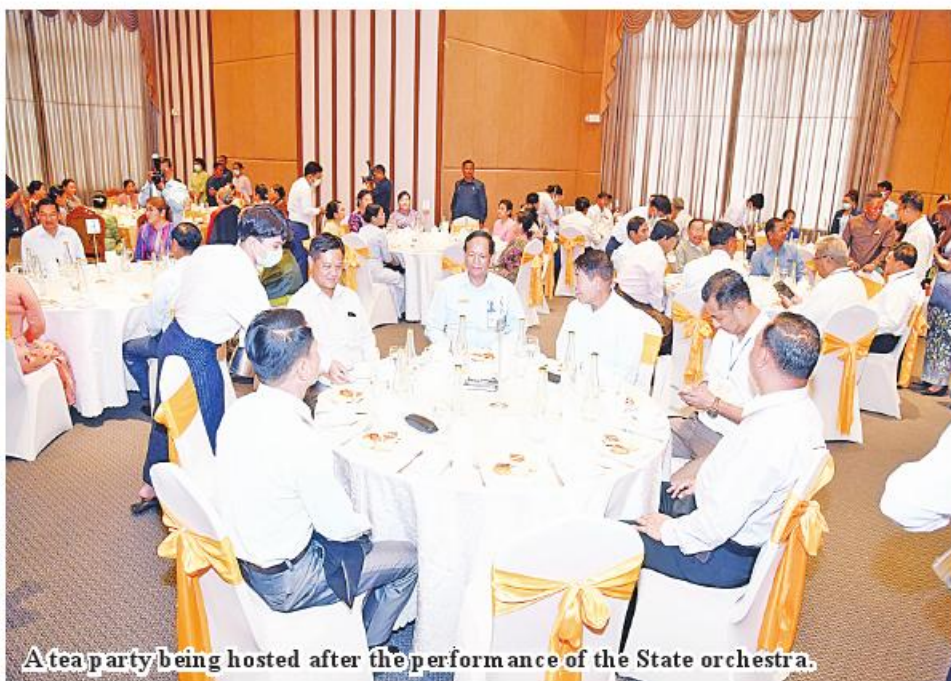
A tea party being hosted after the performance of the State orchestra.

chestra and musical instruments was screened. When the State Orchestra played the national anthem, the Senior General and attendees saluted it. The State Orchestra played the ASEAN Anthem and MNSO overture of the orchestra and other musical entertainments. The Senior General, wife