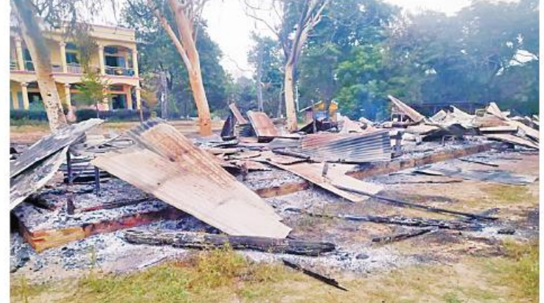
PDF အမည်ခံ အကြမ်းဖက်သမားများက နွားထိုးကြီးမြို့နယ် မင်းရွာကျေးရွာရှိ အခြေခံပညာအထက်တန်းကျောင်း(ခွဲ)အား မီးရှို့ပျက်ဆီးခဲ့မှုကို တွေ့ရစဉ်။

နံနက် ၁၀ နာရီခန့်တွင် နွားထိုးကြီး - မြင်းခြံသွားကားလမ်း မိုးကန်ကျေးရွာအနီးသို့ အရောက်၍ လမ်းညာဘက် ၁၀ ပေခန့်အကွာမှ PDF အမည်ခံအကြမ်းဖက်သမားများက လက်လုပ်အဝေးထိန်းမိုင်းများဖြင့် ထပ်မံဖောက်ခွဲ တိုက်ခိုက်ခဲ့သောကြောင့် လုံခြုံရေးတပ်ဖွဲ့ဝင်အချို့ ထိခိုက်ဒဏ်ရာရရှိခဲ့ကြောင်း သိရသည်။ အကြမ်းဖက်သမားများ အနေဖြင့် အပြစ်မဲ့ပြည်သူများအား အကြောင်းမဲ့ သတ်ဖြတ်ခြင်း၊ ကျောင်းသား၊ ကျောင်းသူများ ပညာသင်ကြားရေးအတွက် အသုံးပြုနေသည့် ကျေးရွာစာသင်ကျောင်းအား ယခုကဲ့သို့ မီးရှို့ပျက်ဆီးခြင်း စစ်ရာဇဝတ်မှု (War Crime) ကျူးလွန်ခြင်းဖြစ်ပြီး