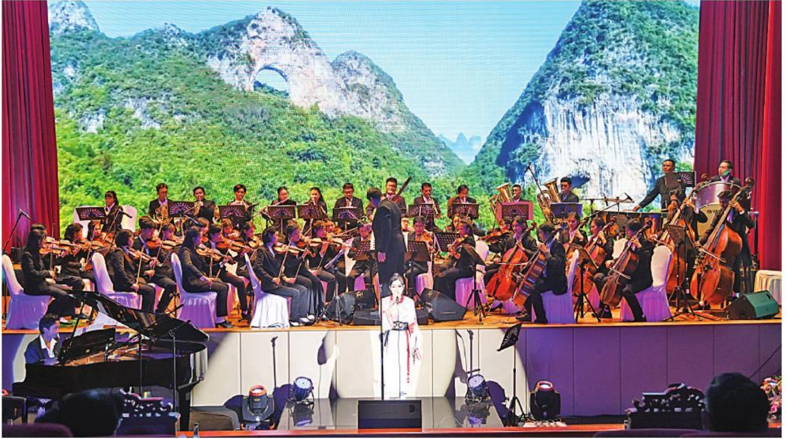
နိုင်ငံတော်သံစုံတီးဝိုင်းအဖွဲ့သားများနှင့် နိုင်ငံကျော်အနုပညာရှင်များက ဖျော်ဖြေတင်ဆက်ကြခြင်း။

ကျေးဇူးတင်စာ အဆင့်မြင့်တပ်မတော် အရာရှိကြီးများနှင့် ဝန်ထမ်းများ၊ ရန်ကင်းတိုင်းစစ်ဌာနချုပ် တိုင်းမှူးနှင့် တာဝန်ရှိသူများ၊ ရွှေရင်း၊ သဘင်၊ ဝိတနှင့် အနုပညာရုပ်ဝန်းအသီးသီးမှ နိုင်ငံကျော်အနုပညာရှင်များ တက်ရောက် အားပေးကြည့်ရှုကြသည်။ ဦးစွာ ဖျော်ဖြေပွဲအခမ်းအနားကို အစီအစဉ်အတိုင်းကျင်းပပြုလုပ်ရာ အခမ်းအနားများက နိုင်ငံတော်သံစုံတီးဝိုင်းများနှင့် နိုင်ငံတော်သံစုံတီးဝိုင်း အကြောင်းအရာ အကျဉ်းကို ရှင်းလင်းတင်ပြသည်။ ထို့နောက် နိုင်ငံတော်သံစုံတီးဝိုင်းနှင့် တူရိယာများဆိုင်ရာ Animation Video Clip ကို တင်ဆက် ပြသသည်။ ယင်းနောက် နိုင်ငံတော်သံစုံတီးဝိုင်းက နိုင်ငံတော်သီချင်းကိုတီးမှုတ်ရာ နိုင်ငံတော် စီမံအုပ်ချုပ်ရေးကောင်စီဥက္ကဋ္ဌ နိုင်ငံတော် ဝန်ကြီးချုပ်နှင့် တက်ရောက်လာကြသူများ က မတ်တတ်ရပ်အလေးပြုကြသည်။ ဆက်လက်ပြီး ASEAN Anthem သံစဉ်နှင့် နိုင်ငံတော်သံစုံတီးဝိုင်း၏ ပဏာမ တေးသွား(MNSO Overture)တို့ကိုလည်း ကောင်းကောင်း တူရိယာအမျိုးအစားများအလိုက် တီးမှုတ်တင်ဆက်၍ လည်းကောင်း နိုင်ငံတော် သံစုံတီးဝိုင်းအဖွဲ့သားများက ဖျော်ဖြေ တင်ဆက်ကြသည်။ ထို့နောက် နိုင်ငံတော်သံစုံတီးဝိုင်းနှင့်