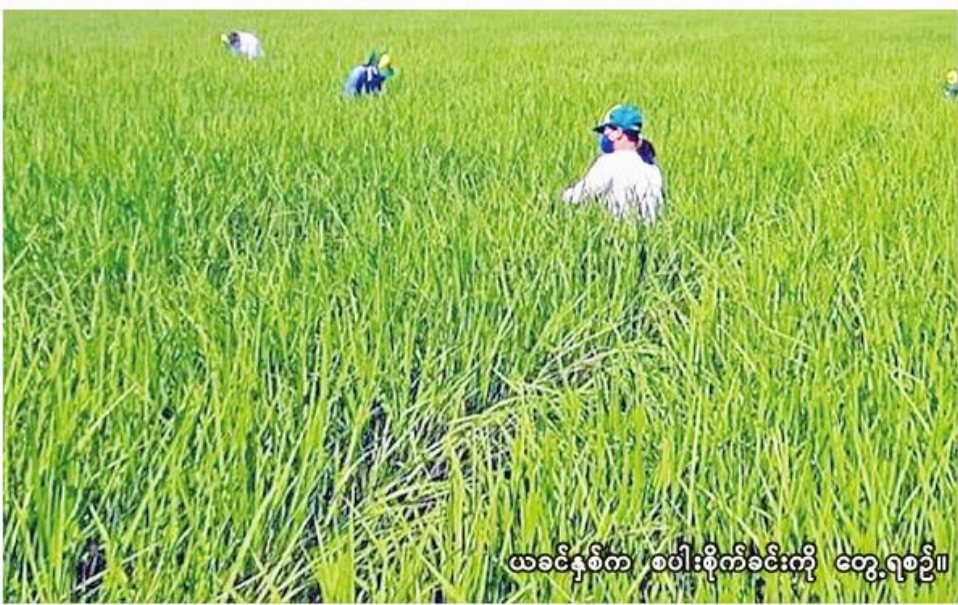
ယခင်နှစ်က စပါးစိုက်ခင်းကို တွေ့ရစဉ်။

ရေဦး၊ ဩဂုတ် ၁၃ စစ်ကိုင်းတိုင်းဒေသကြီး ရေဦးခရိုင်တွင် ယခုနှစ် မိုးသီးနှံစိုက်ပျိုးရာသီ၌ မိုးစပါး ၆၂၈၆ ဧက စိုက်ပျိုးပြီးစီးပြီဖြစ်ကြောင်း ရေဦးခရိုင် စိုက်ပျိုးရေးဦးစီးဌာနမှ သိရသည်။ ရေဦးခရိုင်တွင် ယခုနှစ် မိုးသီးနှံစိုက်ပျိုးရာသီ၌ မိုးစပါး ၂၉၅၄၅၄ ဧကစိုက်ပျိုးရန်လျာထားပြီး ယခုနှစ် ဇွန်လက စတင်စိုက်ပျိုးခဲ့ရာ ယနေ့ထိ မိုးစပါး ၆၂၈၆ ဧက စိုက်ပျိုးပြီးစီးပြီဖြစ်ကြောင်း သိရသည်။ “ဒီနှစ် မိုးသီးနှံစိုက်ပျိုးရာသီမှာ ရေဦးခရိုင်အတွင်း မိုးစပါးဧက ၂၀၀၀၀ ကျော်စိုက်ပျိုးဖို့လျာထားပါတယ်။ လက်ရှိမှာတော့ မိုးစပါး ၆၀၀၀ ကျော်စိုက်ပျိုးပြီးစီးပါပြီ။ မိုးစပါးဧက လျာထားချက်ပြည့်မီအောင် စိုက်ပျိုးသွားပါမယ်။” ရေဦးခရိုင်တွင် မြို့နယ်