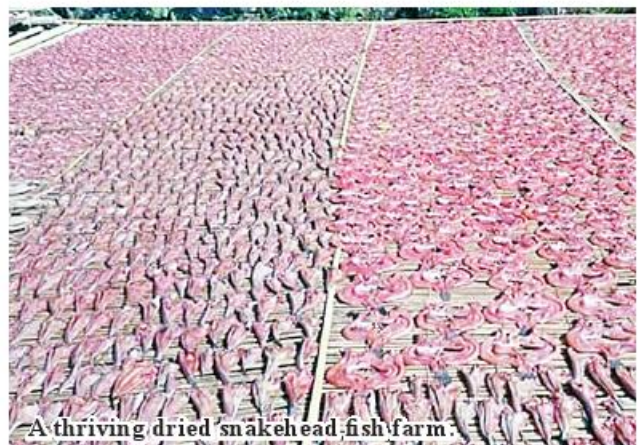
A thriving dried snakehead fish farm.