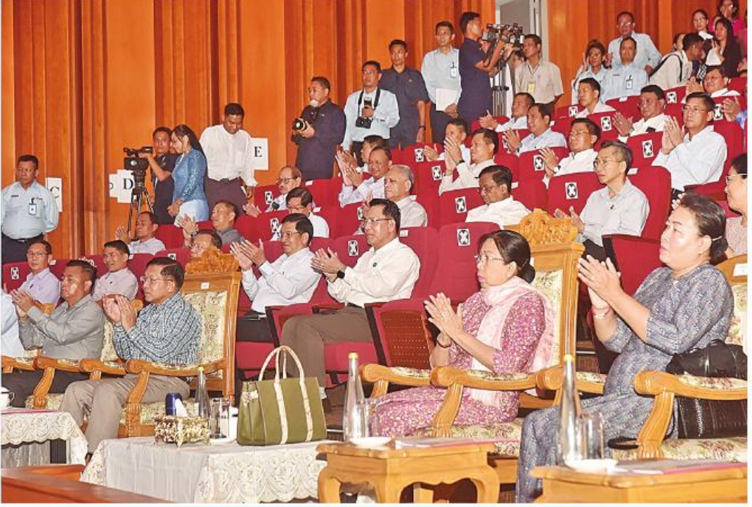
နိုင်ငံတော်စီမံအုပ်ချုပ်ရေးကောင်စီဥက္ကဋ္ဌ နိုင်ငံတော်ဝန်ကြီးချုပ် ဗိုလ်ချုပ်မှူးကြီးမင်းအောင်လှိုင်နှင့် ဇနီး ဒေါ်ကြူကြူလှ နိုင်ငံတော်သံစုံတီးဝိုင်းဖျော်ဖြေတင်ဆက်မှုကို ကြည့်ရှုအားပေးစဉ်။

နေပြည်တော် ဩဂုတ် ၁၃ ယနေ့မွန်းလွဲပိုင်းတွင် ရန်ကင်းမြို့နယ် ဗိုလ်ချုပ်မှူးကြီးမင်းအောင်လှိုင် တက် ဝန်ကြီးချုပ်နှင့်အတူ ဇနီး ဒေါ်ကြူကြူလှ၊ ဒေသကြီးဝန်ကြီးချုပ်၊ ညှိနှိုင်းကွပ်ကဲရေး ပြန်ကြားရေးဝန်ကြီးဌာန မြန်မာ့ မြဝတီမီဒီယာစင်တာရှိ Theatre ၌ ရောက်ကြည့်ရှုအားပေးသည်။ ကောင်စီတွဲဖက်အတွင်းရေးမှူး ဒုတိယ မှူးကြီးမင်းအောင်လှိုင်နှင့် ဇနီး၊ ကာကွယ်ရေး အသံနှင့်ရုပ်မြင်သံကြား နိုင်ငံတော် ပြုလုပ်ရာ နိုင်ငံတော်စီမံအုပ်ချုပ်ရေး အဆိုပါဖျော်ဖြေပွဲသို့ နိုင်ငံတော်စီမံ ဗိုလ်ချုပ်ကြီးရဲဝင်းဦးနှင့် ဇနီး၊ ပြည်ထောင်စု ဦးစီးချုပ် ရုံးမှ သံစုံတီးဝိုင်း ဖျော်ဖြေတင်ဆက်မှုကို ကောင်စီဥက္ကဋ္ဌ နိုင်ငံတော်ဝန်ကြီးချုပ် အုပ်ချုပ်ရေးကောင်စီဥက္ကဋ္ဌ နိုင်ငံတော် ဝန်ကြီးများနှင့် ဇနီးများ၊ ရန်ကုန်တိုင်း