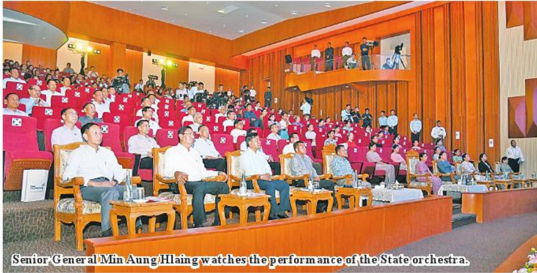
Senior General Min Aung Hlaing watches the performance of the State orchestra.