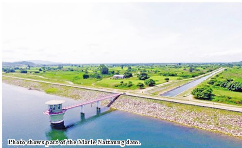
Photo shows part of the Marle Nattaung dam.

Mandalay August 13 Marle Nattaung Dam in Singu Township of Mandalay Region is scheduled to irrigate more than 3,200 acres of monsoon paddy plantations this year, said assistant