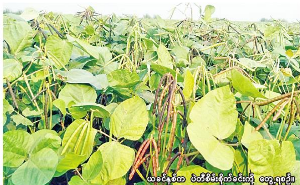
ယခင်နှစ်က ပဲတီစိမ်းစိုက်ခင်းကို တွေ့ရစဉ်။