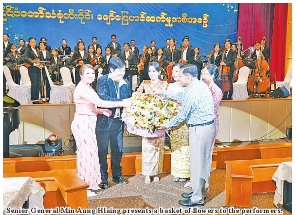
Senior General Min Aung Hlaing presents a basket of flowers to the performers.

Office of the Commander-in-Chief and their wives, the commander of Yangon Command, officials, and renowned artists from film, theatrical, music and fine arts arenas. First, the master of ceremonies presented a brief report about international orchestras and the State Orchestra. Next, an animation video clip on the State Or-