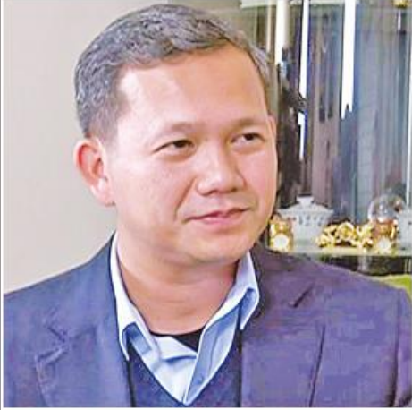
ကမ္ဘောဒီးယားဘုရင်နိုင်ငံ၏ ဝန်ကြီးချုပ် အဖြစ် တာဝန်ထမ်းဆောင်မည့် ဟွန်မာနက်။

ကမ္ဘောဒီးယားဘုရင် နိရိုဒ္ဒန်သီဟာမိနီသည် ဟွန်မာနက်ကို တိုင်းပြည်၏ ဝန်ကြီးချုပ်အဖြစ် အဖြစ်အပျော် ဩဂုတ်လ ၇ ရက်တွင် တရားဝင်အတည်ပြုခဲ့သည်။ ဘုရင်အမိန့်ဖြင့် ဟွန်မာနက်သည် ကမ္ဘောဒီးယား ဘုရင်နိုင်ငံ၏ ဝန်ကြီးချုပ်အဖြစ် တာဝန်ထမ်းဆောင် သွားမည်ဖြစ်ကြောင်းနှင့် ကျမ်းသစ္စာကျိန်ဆိုပြီးချိန် တွင် အစိုးရသစ်တစ်ရပ် ဖွဲ့စည်းသွားမည်ဖြစ်ကြောင်း ဖော်ပြထားသည်။