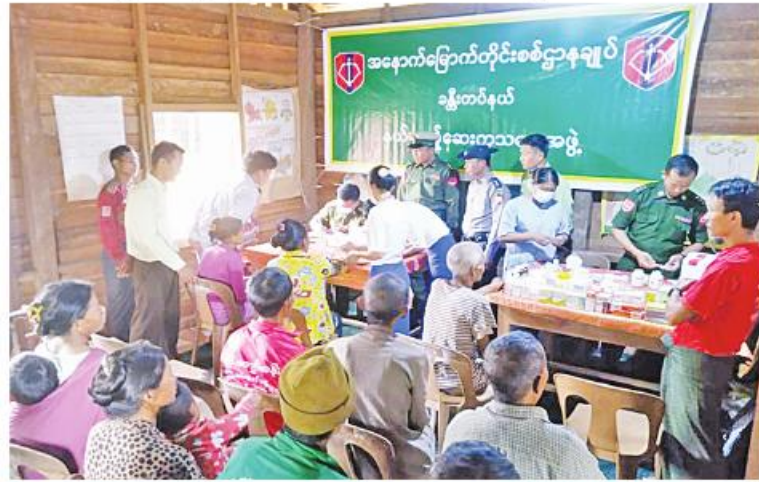
အနောက်မြောက်တိုင်းစစ်ဌာနချုပ် နယ်လှည့်ဆေးကုသရေးအဖွဲ့က ဒေသခံပြည်သူများကို ကျန်းမာရေးစောင့်ရှောက်မှုလုပ်ငန်းများ ဆောင်ရွက်ပေးစဉ်။ ကုသပေးခြင်းများ ဆောင်ရွက်ပေးသည်။ တပ်နယ်မှ တာဝန်ရှိသူများက သွားရောက်ယင်းသို့ ဆောင်ရွက်နေမှုများကို ခန့်မှန်းကြည့်ရှုအားပေးခဲ့ကြောင်း သတင်းရရှိသည်။

နေပြည်တော် ဩဂုတ် ၁၃ စစ်ကိုင်းတိုင်းဒေသကြီး လဟယ်မြို့နယ် မွန်ထွေကျေးရွာရှိ ဒေသခံပြည်သူများကို ယနေ့တွင် အနောက်မြောက်တိုင်းစစ်ဌာနချုပ် နယ်လှည့်ဆေးကုသရေးအဖွဲ့က အဆိုပါကျေးရွာရှိ အခြေခံပညာမူလတန်းကျောင်း၌ ကျန်းမာရေးစောင့်ရှောက်မှုလုပ်ငန်းများ ဆောင်ရွက်ပေးသည်။ ထိုသို့ ဆောင်ရွက်ပေးလျက်ရှိရာ ဒေသခံပြည်သူ ၉၂ ဦးတို့ကို သွေးတိုးရောဂါ၊ အထွေထွေအားနည်းရောဂါ၊ ဖျားနာရောဂါ၊ သွားနှင့်ခံတွင်းရောဂါ၊ နှလုံးရောဂါ၊ အရိုးအကြောရောဂါ၊ အစာအိမ်နှင့် အူလမ်းကြောင်းဆိုင်ရာရောဂါ၊ အသည်းရောဂါ၊ သားဖွားမီးယပ်ရောဂါ၊ အထွေထွေရောဂါတို့နှင့် ပတ်သက်၍ လိုအပ်သည် ကျန်းမာရေးစစ်ဆေး