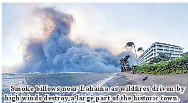
Smoke billows near Lahaina as wildfires driven by high winds destroy a large part of the historic town.