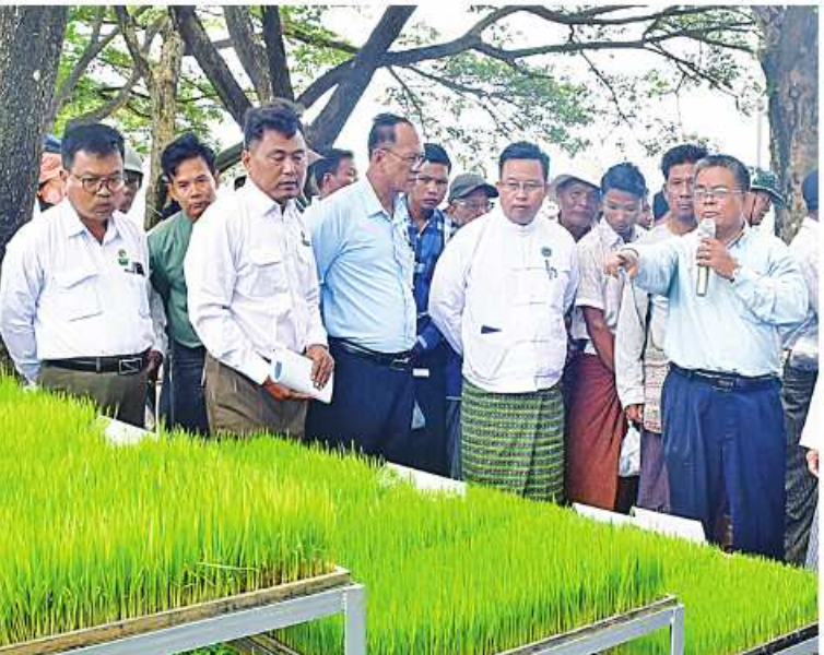
ခြင်းလုပ်ငန်းဆောင်ရွက်နေမှုများကို ကြည့်ရှု သန့်ရှင်းစေရေးဆောင်ရွက်ကြရန် မှာကြား စစ်ဆေးပြီး မင်္ဂလာကန်ရေပြင်ကြည့်လင် ခဲ့ကြောင်း သတင်းရရှိသည်။ (သတင်းစဉ်)

တမံဆိုင်ရာအချက်အလက်များ၊ ဆည်အတွင်း သို့ ရေဝင်ရောက်မှု၊ ရေသိုလှောင်ထားရှိမှု၊ စိုက်ပျိုးရေးပေးဝေမှု အခြေအနေများကို ရှင်းလင်းတင်ပြကြရာ နေပြည်တော် ကောင်စီဥက္ကဋ္ဌက လိုအပ်သည်များကို မှာကြားပြီး ဆည်အတွင်းရေဝင်ရောက်မှု အခြေအနေကို ကြည့်ရှုစစ်ဆေးသည်။ မွန်းလွဲပိုင်းတွင် နေပြည်တော်ကောင်စီ ဥက္ကဋ္ဌ မြို့တော်ဝန် ဦးသန်းထွန်းဦးသည် နေပြည်တော်ကောင်စီအဖွဲ့ဝင် ဝိုင်းဖျားကြီး မင်းနောင်၊ ဒုတိယမြို့တော်ဝန် ဦးမောင် မောင်၊ တာဝန်ရှိသူများနှင့်အတူ မင်္ဂလာကန် အမှတ်(၂)၏ကန်ပတ်လမ်းတွင် ဆောင်ရွက် နေသည့် မော်တော်ယာဉ်ရပ်နားရန်နေရာ ပါဝင်သော မြေယာရှာခင်းအတွက် မြေပြင် ဆင်နေမှုနှင့် ပန်းအလှပင်စိုက်ပျိုးမှု ကြာနှင့် ဗေဒါများ၊ အမှိုက်များကိုဆယ်ယူရှင်းလင်း