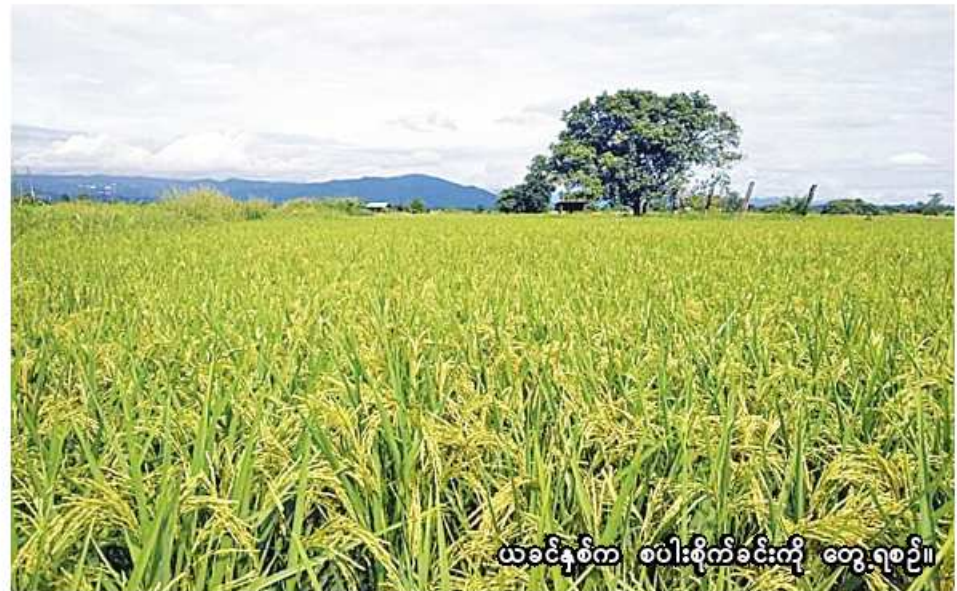
ယခင်နှစ်က စပါးစိုက်ခင်းကို တွေ့ရစဉ်။