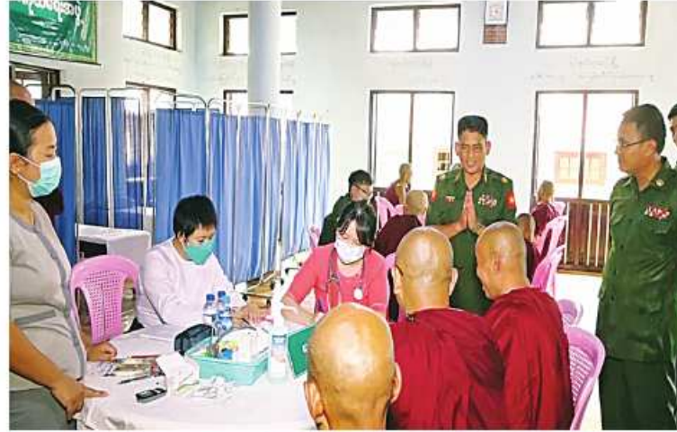
သံဃာတော်များအား အရှေ့မြောက်တိုင်းစစ်ဌာနချုပ် နယ်လှည့်ဆေးကုသရေးအဖွဲ့က ကျန်းမာရေးစောင့်ရှောက်မှုလုပ်ငန်းများ ဆောင်ရွက်ပေးနေမှုကို တာဝန်ရှိသူများက ကြည့်ရှုအားပေးစဉ်။

နေပြည်တော် ဩဂုတ် ၁၀ - ကချင်ပြည်နယ် မြစ်ကြီးနားမြို့ပေါ်ရှိ သံဃာတော်များကို ယနေ့နံနက်ပိုင်းတွင် မြောက်ပိုင်းတိုင်းစစ်ဌာနချုပ် နယ်လှည့် ဆေးကုသရေးအဖွဲ့က မြစ်ကြီးနားမြို့ရှိ အောင်ဇေရန်အောင် တပ်ဦးကျောင်းတိုက် ဝင်းအတွင်း၌ ကျန်းမာရေးစောင့်ရှောက်မှု လုပ်ငန်းများ ဆောင်ရွက်ပေးသည်။