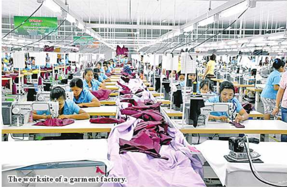
The worksite of a garment factory.

Nay Pyi Taw August 10 Myanmar pocketed US$2,394.899 million from export of finished industrial goods to foreign countries from April to July of the