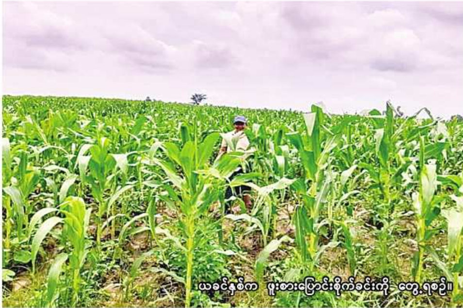
ယခုနှစ်က ဖူးစားပြောင်းစိုက်ခင်းကို တွေ့ရစဉ်။

အစေ့ထုတ်ပြောင်းကေ ၁၇၉၅၀၊ ဖူးစားပြောင်း ၅၇၃၉ ကေ၊ ကလေးခရိုင်မြို့နယ်တွင် အစေ့ထုတ်ပြောင်း ၂၁၅ ကေ၊ ဖူးစားပြောင်း ၂၃၆၅ ကေနှင့် မင်းကင်းမြို့နယ်တွင် အစေ့ထုတ်ပြောင်း ၅၅၁ ကေ၊ ဖူးစားပြောင်း ၃၃၃၇ ကေ စုစုပေါင်း ၃၀၁၅၇ ကေတို့ဖြစ်ကြောင်း သိရသည်။