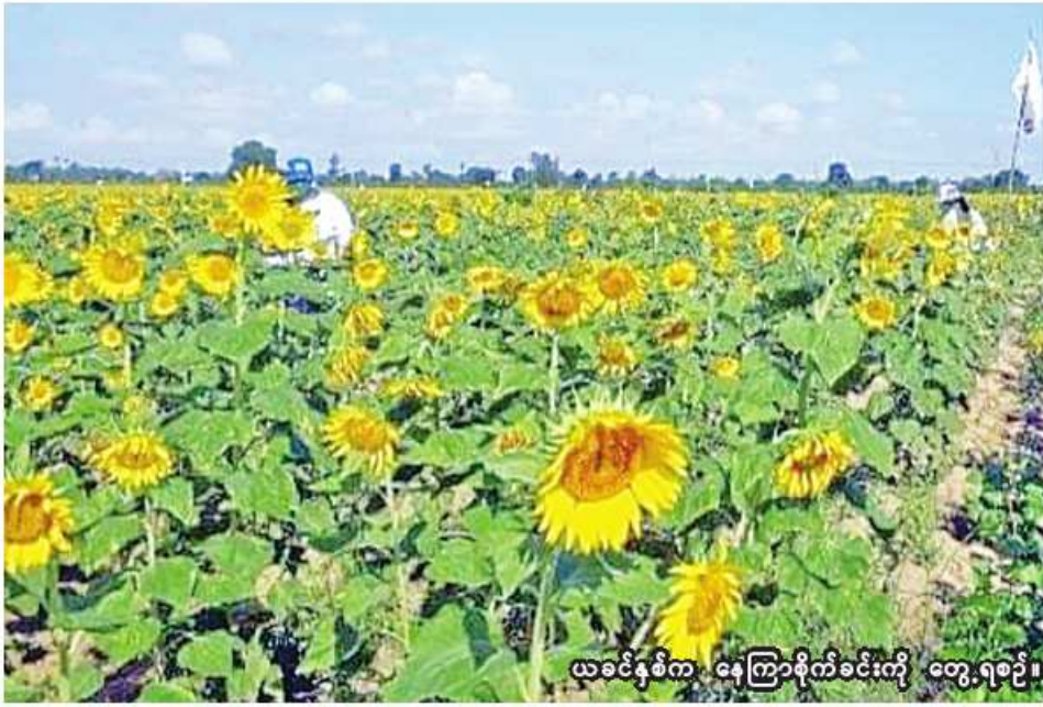
ယခင်နှစ်က နေကြာစိုက်ခင်းကို တွေ့ရစဉ်။