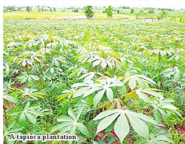
A tapioca plantation.

Yangon market. This summer, tapioca fetches K3,500 per viss in the domestic market. Kyaw Kyaw Lin