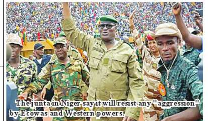
The junta in Niger, say it will resist any "aggression" by Ecowas and Western powers.

Niamey August 10 The US and UN are concerned about the health and safety of Niger's elected President Mohamed Bazoum, who has spent more than two weeks under house arrest. "We are greatly worried about his health and his personal safety and the personal safety of his family," a US state department spokesman said.