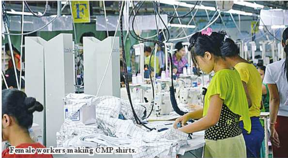
Female workers making CMP shirts.

Nay Pyi Taw August 10 The Ministry of Commerce mentioned that earnings of exporting CMP products reached up to US$1,085.744 million during the period from April