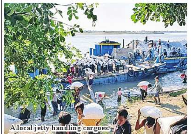
A local jetty handling cargoes.