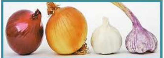
ကြက်သွန်ဖြူနှင့် ကြက်သွန်နီတူးသုံးပေးခြင်းဖြင့် နှလုံးနှင့်အဆုတ်အတွက် အထူးကောင်းမွန်သည်။

ကိုပိစ်-၁၃ ရောဂါကူးစက်မှုကာကွယ်ရာတွင် အထောက်အကူပြုပေးရန်