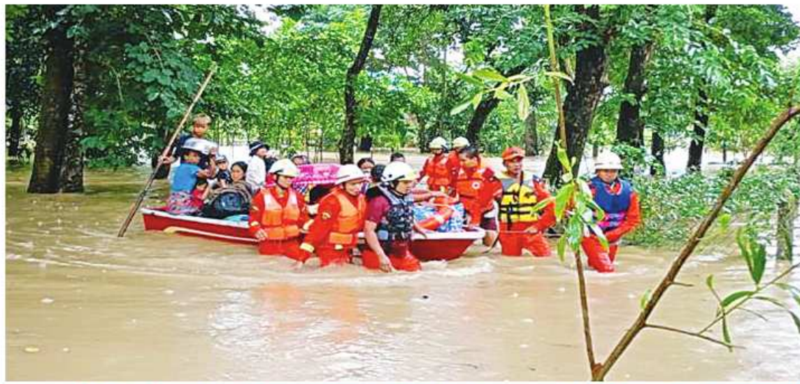
တောင်ပိုင်းတိုင်းစစ်ဌာနချုပ် ကွပ်ကဲမှုအောက်ရှိ နယ်မြေခံတပ်မတော်သားများ၊ မြန်မာနိုင်ငံရဲတပ်ဖွဲ့ဝင်များ၊ မီးသတ် တပ်ဖွဲ့ဝင်များ၊ လူမှုရေးအသင်းအဖွဲ့များက ရေဘေးသင့်ပြည်သူများကို ယာယီကယ်ဆယ်ရေးစခန်းများသို့ ကူညီရွှေ့ပြောင်း ပေးစဉ်။

နေပြည်တော် ၊ ဩဂုတ် ၁၀ နယ်မြေခံတပ်မတော်သားများ၊မြန်မာနိုင်ငံ လုပ်ငန်းများ ဆောင်ရွက်ပေးကြသည်။ ပဲခူးတိုင်းဒေသကြီး ပဲခူးမြို့နယ်၌ ရဲတပ်ဖွဲ့ဝင်များ၊ မီးသတ်တပ်ဖွဲ့ဝင်များ၊ ထိုသို့ ဆောင်ရွက်ပေးနေမှုများကို ဩဂုတ် ၈ ရက်နှင့် ၉ ရက်တို့တွင် မိုးသည်း ထန်စွာရွာသွန်းပြီး မြေနိမ့်ပိုင်းရပ်ကွက် များရှိ နေအိမ်များအတွင်းသို့ ရေဝင်ရောက် မှုများ ဖြစ်ပေါ်ခဲ့ရာ ယနေ့တွင် တောင်ပိုင်း တိုင်းစစ်ဌာနချုပ် ကွပ်ကဲမှုအောက်ရှိ များနှင့် ကျန်းမာရေးစောင့်ရှောက်မှု ရွက်ပေးခဲ့ကြောင်း သတင်းရရှိသည်။