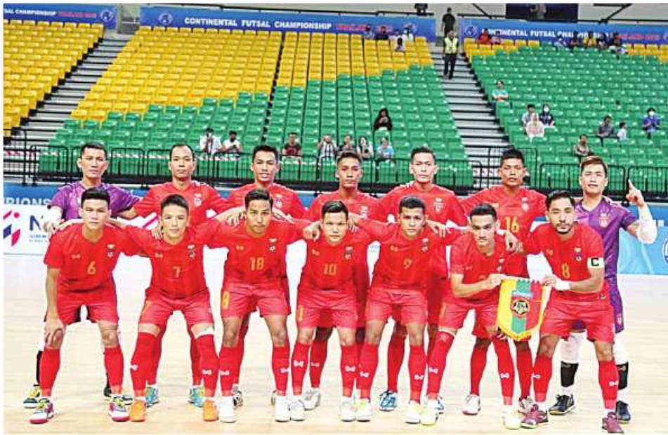
ချစ်ခြင်းဖြစ်သည်။ အလားတူ အုပ်စု(၁)တွင်လည်း ချက်ဖူဆယ်အသင်းက အုပ်စုပထမ ဖြင့်လည်းကောင်း၊ အာဖဂန်နစ္စတန် အသင်းက အုပ်စုဒုတိယဖြင့်လည်းကောင်း တက်ရောက်နိုင်ခဲ့ခြင်းဖြစ်သည်။

ရန်ကုန် ဩဂုတ် ၁၀ ထိုင်းနိုင်ငံက အိမ်ရှင်အဖြစ် လက်ခံကျင်းပလျက်ရှိနေသည့် ထိုင်းဖိတ်ခေါ် ဖူဆယ်ပြိုင်ပွဲ ဆီမီးပိုင်နယ် အဆင့်ပွဲစဉ်အဖြစ် မြန်မာဖူဆယ်အသင်းနှင့် ချက်ဖူဆယ်အသင်းတို့ ကစားရမည်ဖြစ်သည်။