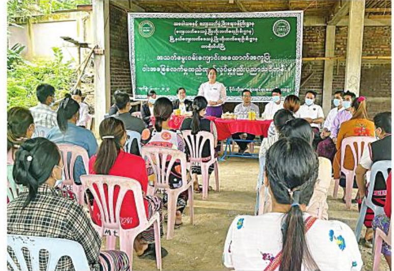
ကျော်စောဦး(မောရမ်းမြေ)

သင်တန်းအတွက် သင်ထောက်ကူပစ္စည်းများ ပေးအပ်သည်။ အဆိုပါ ဝါးအခြေခံ လက်မှုထည်ထုတ်လုပ်မှုနည်းပညာသင်တန်းကို မိုင်းကိုးကျေးရွာအုပ်စု မောတို့ကျေးရွာမှ သင်တန်းသားဦးရေ ၂၀ တက်ရောက်ကြပြီး သင်တန်းတွင် ကျွမ်းကျင်နည်းပြများက ဝါးအခြေခံလက်မှုထည် ထုတ်လုပ်နည်းများကို ဩဂုတ် ၈ ရက်မှ ၂၁ ရက်ထိ စာတွေ့လက်တွေ့အခမဲ့ သင်ကြားပို့ချပေးသွားမည်ဖြစ်ကြောင်း တာချီလိတ်မြို့နယ် ကျေးလက်ဒေသဖွံ့ဖြိုးတိုးတက်ရေးဦးစီးဌာနမှ သိရသည်။