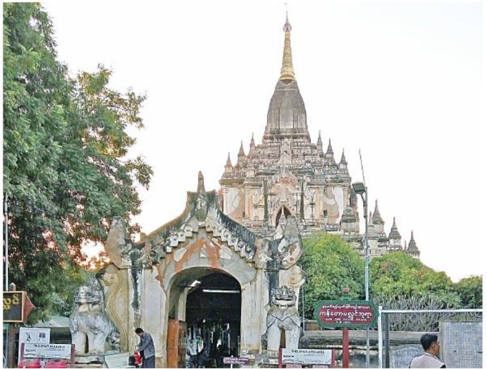
ပုဂံရှိ ကန်တော့ပလ္လင်ဘုရားကို တွေ့ရစဉ်။

ကန်တော့ပလ္လင်ဘုရား အောက်ခံတိုက်မသည် အရှေ့ဘက်သို့မျက်နှာမူထားကာ မုခ်ပေါက်ကြီးလေးခု