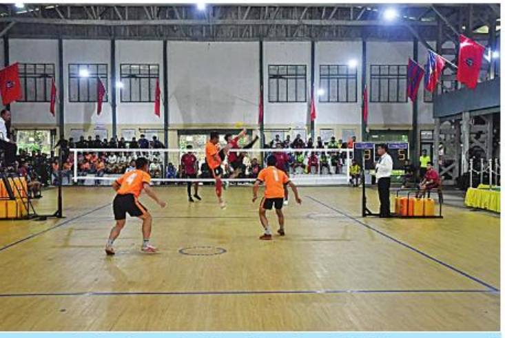
အရှေ့တောင်တိုင်းစစ်ဌာနချုပ် တိုင်းမှူးဒိုင်း ပိုက်ကျော်ခြင်းပြိုင်ပွဲ ပထမနေ့ ပွဲစဉ် များ ယှဉ်ပြိုင်ကစားစဉ်

နေပြည်တော် ဩဂုတ် ၈ အရှေ့တောင်တိုင်းစစ်ဌာနချုပ် ၂၀၂၃ ခုနှစ် တိုင်းမှူးဒိုင်း ပိုက်ကျော်ခြင်းပြိုင်ပွဲ ဖွင့်ပွဲကို ယနေ့ ညနေပိုင်းတွင် တိုင်းစစ်ဌာန ချုပ် ပြည်ဇာနည် အားကစားခန်းမ၌ ပြုလုပ်ရာ တိုင်းမှူး ဗိုလ်မှူးချုပ်စိုးမင်းနှင့် အဖွဲ့ဝင်များ၊ ဌာနဆိုင်ရာတာဝန်ရှိသူများ၊ အရာရှိ၊ စစ်သည်၊ မိသားစုဝင်များ၊ ဒိုင်အဖွဲ့ဝင်များ၊ ပြိုင်ပွဲဝင်အားကစားသမား များနှင့် အားကစားဝါသနာရှင်များ တက်ရောက်ကြသည်။ ဦးစွာ တိုင်းမှူးက အမှာစကားပြော ကြားသည်။ ထို့နောက် တိုင်းမှူးနှင့် တက်ရောက်လာကြသူများက ပြိုင်ပွဲ ပထမနေ့ ပွဲစဉ်များ ယှဉ်ပြိုင်ကစားနေမှုများ ကို ကြည့်ရှုအားပေးကြသည်။ အဆိုပါ တိုင်းမှူးဒိုင်း ပိုက်ကျော်ခြင်း ပြိုင်ပွဲကို တိုင်းစစ်ဌာနချုပ်ကွပ်ကဲမှုအောက် တပ်နယ်အသီးသီးမှ ပြိုင်ပွဲဝင်အသင်း ၁၆ သင်းဖြင့် ဩဂုတ် ၁၄ ရက်ထိ ယှဉ်ပြိုင် ကစားသွားမည်ဖြစ်ကြောင်း သတင်း ရရှိသည်။