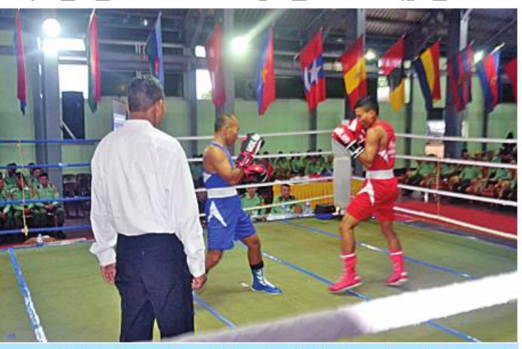
အရှေ့ပိုင်းတိုင်းစစ်ဌာနချုပ် တိုင်းမှူးတံခွန်စိုက်ဒိုင်း လက်ဝှေ့ပြိုင်ပွဲ အဖွင့် ပွဲစဉ်ယှဉ်ပြိုင်နေမှုကို တွေ့ရစဉ်

နေပြည်တော် ဩဂုတ် ၈ အရှေ့ပိုင်းတိုင်းစစ်ဌာနချုပ် ၂၀၂၃ ခုနှစ် တိုင်းမှူးဒိုင်းလက်ဝှေ့ပြိုင်ပွဲ ဖွင့်ပွဲကို ဩဂုတ် ၇ ရက် ညနေပိုင်းတွင် နယ်မြေခံ သင်တန်းကျောင်းဝင်း အားကစားခန်းမ၌ ပြုလုပ်ရာ ဒုတိယတိုင်းမှူး ဗိုလ်မှူးချုပ် ဝင်းဇော်မိုးနှင့် တာဝန်ရှိသူများ၊ အရာရှိ၊ စစ်သည်၊ မိသားစုများ၊ ဒိုင်အဖွဲ့ဝင်များနှင့် ပြိုင်ပွဲဝင် အားကစားသမားများ တက်ရောက်ကြသည်။ ဦးစွာ ဒုတိယတိုင်းမှူးက အမှာစကား ပြောကြားသည်။ထို့နောက် ဒုတိယတိုင်းမှူး နှင့် တက်ရောက်လာကြသူများက အဖွင့် ပွဲစဉ်ယှဉ်ပြိုင်နေမှုများကို ကြည့်ရှုအားပေး ကြသည်။ အဆိုပါ ပြိုင်ပွဲကို တိုင်းစစ်ဌာနချုပ် ကွပ်ကဲမှုအောက် တပ်ရင်း၊တပ်ဖွဲ့များမှ ပြိုင်ပွဲဝင်အသင်း ရှစ်သင်းဖြင့် ဩဂုတ် ၁၄ ရက်ထိ ကျင်းပပြုလုပ်သွားမည် ဖြစ်ကြောင်း သတင်းရရှိသည်။