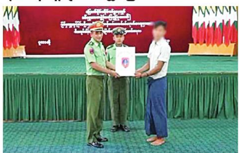
နယ်မြေခံတပ်မှ တာဝန်ရှိသူတစ်ဦးက PDF အဖွဲ့ဝင်တစ်ဦးကို ထောက်ပံ့ပစ္စည်းများ ပေးအပ်စဉ်။

နေပြည်တော် ဩဂုတ် ၈ - နိုင်ငံတော်စီမံအုပ်ချုပ်ရေး ကောင်စီသည် PDF အပါအဝင် အဖွဲ့အစည်းအမျိုးမျိုးအမည်ခံ၍ လက်နက်ကိုင် ဆန့်ကျင်လျက်ရှိသည့် အဖွဲ့အစည်းများအတွင်း ရောက်ရှိနေသူများကို ဥပဒေဘောင်အတွင်းသို့ ပြန်လည်ဝင်ရောက်ရန် ဖိတ်ခေါ်လျက်ရှိရာ ဥပဒေဘောင်အတွင်းသို့ ဝင်ရောက်လာသူများကို လိုအပ်သည့် ကူညီပံ့ပိုးမှုများ ဆောင်ရွက်ပေးသွားမည် ဖြစ်ကြောင်းနှင့် လက်နက်၊ ခဲယမ်းများဖြင့် ဝင်ရောက်လာသူများကို ဆုကြေးငွေများ ထောက်ပံ့ပေးသွားမည်ဖြစ်ကြောင်း ထုတ်ပြန်ထားရှိပြီးဖြစ်ရာ ဩဂုတ် ၇ ရက်တွင်လည်း ပြစ်မှုကျူးလွန်ခြင်းမရှိသော PDF အဖွဲ့မှ အလင်းဝင်ရောက်လာသူများကို မိဘအုပ်ထိန်းသူများထံ ပြန်လည်လွှဲပြောင်းပေးအပ်ခြင်းကို ကချင်ပြည်နယ် ပူတာအိုမြို့ရှိ ဗန္ဓုလခန်းမ၌ပြုလုပ်ရာ နယ်မြေခံတပ်မှ တာဝန်ရှိသူများ၊ ပူတာအိုခရိုင်၊ မြို့နယ်စီမံအုပ်ချုပ်ရေးအဖွဲ့ဝင်များ၊ ဥပဒေဘောင်အတွင်းဝင်ရောက်လာသူများနှင့် ၎င်းတို့၏ မိဘအုပ်ထိန်းသူများ တက်ရောက်ကြသည်။