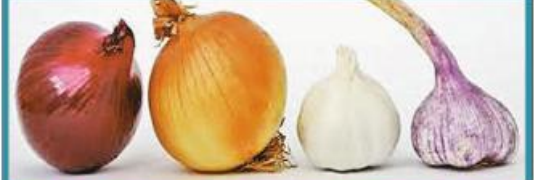
ကြက်သွန်ဖြူနှင့် ကြက်သွန်နီစားသုံးပေးခြင်းဖြင့် နှလုံးနှင့်အဆုတ်အတွက် အထူးကောင်းမွန်သည်။

ကိုဗစ်-၁၉ ရောဂါကူးစက်မှုကိုကာကွယ်ရာတွင် အဆောက်အအုံပြင်ရေး