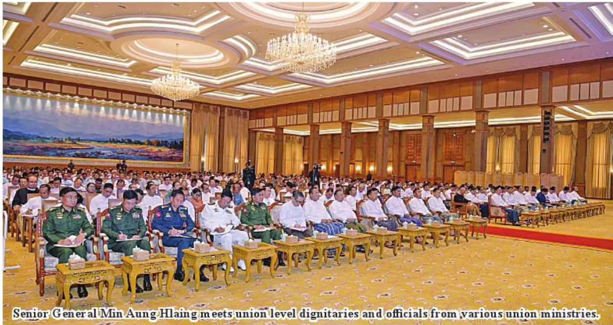
Senior General Min Aung Hlaing meets union level dignitaries and officials from various union ministries.