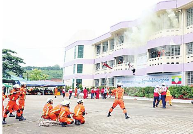
ကျိုင်းတုံမြို့ ကျိုင်းတုံတက္ကသိုလ်၌ မြေလျင်သဏ္ဍာန်ဇာတ်တိုက်လေ့ကျင့်ခြင်း ဆောင်ရွက်နေမှုကို တွေ့ရစဉ်

နေပြည်တော် ဩဂုတ် ၈ ရှမ်းပြည်နယ်(အရှေ့ပိုင်း) ကျိုင်းတုံမြို့ ကျိုင်းတုံတက္ကသိုလ်၌ မြေလျင်သဏ္ဍာန် ဇာတ်တိုက်လေ့ကျင့်ခြင်းကို ယနေ့ နံနက် ပိုင်းတွင် အဆိုပါတက္ကသိုလ်၌ ပြုလုပ်ရာ ကြိုတင်ဒေသတိုင်းစစ်ဌာနချုပ် တိုင်းမှူး ဗိုလ်ချုပ်အောင်ခိုင်ဝင်းနှင့် အဖွဲ့ဝင်များ ပြည်နယ်၊ ခရိုင်၊မြို့နယ်အဆင့် ဌာနဆိုင်ရာ တာဝန်ရှိသူများ၊ ကျိုင်းတုံတက္ကသိုလ်မှ ဆရာ၊ ဆရာမများ၊ ကျောင်းသား၊ ကျောင်းသူများ၊ ကြက်ခြေနီတပ်ဖွဲ့ဝင်များ၊ မြန်မာနိုင်ငံ မီးသတ်တပ်ဖွဲ့ဝင်များ၊ မြန်မာ နိုင်ငံရဲတပ်ဖွဲ့ဝင်များနှင့် ပရဟိတအဖွဲ့ များ တက်ရောက်ကြသည်။ ဦးစွာ တိုင်းမှူးက အမှာစကားပြောကြား သည်။ ထို့နောက် ဘေးအန္တရာယ်ဆိုင်ရာ စီမံခန့်ခွဲမှုဦးစီးဌာနမှ တာဝန်ရှိသူတစ်ဦးက မြေလျင်သဏ္ဍာန် ဇာတ်တိုက်လေ့ကျင့် ခန်းဆောင်ရွက်ရသည့် ရည်ရွယ်ချက် များကို ရှင်းလင်းတင်ပြသည်။ ၎င်းနောက်