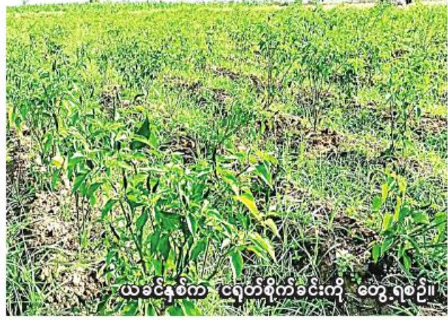
ယခင်နှစ်က ငရုတ်စိုက်ခင်းကို တွေ့ရစဉ်။

ဧက စိုက်ပျိုးပြီးစီး ဧကတို့ဖြစ်ကြောင်း သိရသည်။ ယခုနှစ် နာဂကိုယ်ပိုင်အုပ်ချုပ်ခွင့်ရဒေသတွင် စားဖိုဆောင်သီးနှံ စိုက်ပျိုးရန် လျာထားမှုအနေဖြင့် လေ့ရှိမြို့နယ်တွင် ငရုတ်ဧက ၁၅၀၊ အာလူး ၂၅၃ ဧက၊ အခြားဟင်းမွှေး ၂၆၅ ဧက၊ ဆွမ္မရာမြို့တွင် ငရုတ် ၁၈၂ ဧက၊ အာလူးဧက ၁၄၀၊ လဟယ်မြို့နယ်တွင် ငရုတ် ၁၂၄ ဧက၊ အာလူး ၄၃ ဧက၊ အခြားဟင်းမွှေး ၄၇၉ ဧက၊ ထန်ပါမြို့တွင် ငရုတ်ဧက ၃၀၊ အာလူး ကိုးဧက၊ အခြားဟင်းမွှေး ၂၅ ဧက၊ နန်းယွန်းမြို့နယ်တွင် ငရုတ်ဧက ၁၇၀၊ ကြက်သွန်နီဧက ၁၀၀၊ အာလူး ၄၅ ဧက၊ အခြားဟင်းမွှေး ၂၃၉ ဧက၊ ခုံဟီးမြို့တွင် ငရုတ် ၁၈၂ ဧက၊ ကြက်သွန်နီဧက ၉၀၊ အာလူး ၂၅ ဧက၊ အခြားဟင်းမွှေး ၁၂၉ ဧက၊ ပန်ဆောင်မြို့တွင် ငရုတ်ဧက ၁၀၀၊ ကြက်သွန်နီ ၁၃၅ ဧက၊ အာလူး ၂၅ ဧက၊ အခြားဟင်းမွှေးဧက ၇၀ ဧက စုစုပေါင်း ၂၆၀၆ ဧကတို့ဖြစ်ကြောင်း သိရသည်။ (၂၀၆)