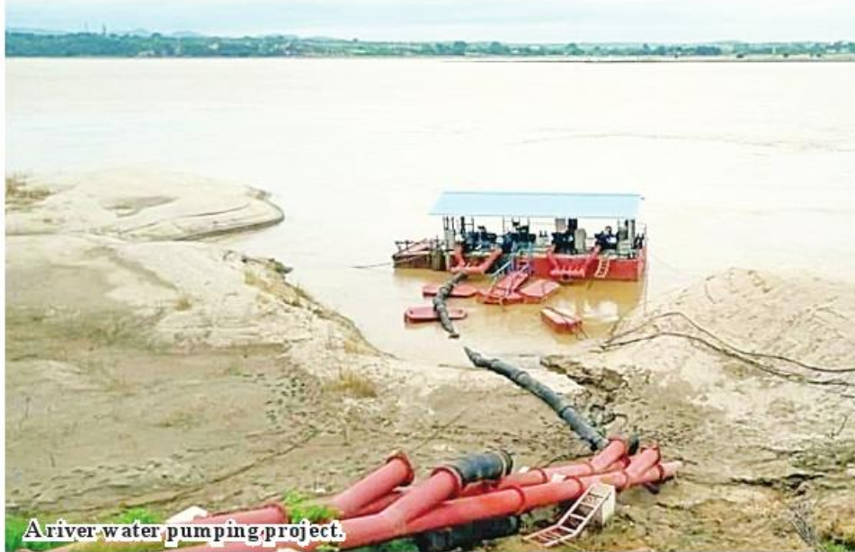
A river water pumping project.

Aunglan August 8 More than 6,000 acres of monsoon crop plantations in Aunglan District are being irrigated by six river water pumping stations, said director U Myint Oo of Magway Region Irrigation and Water Utilization Management De-