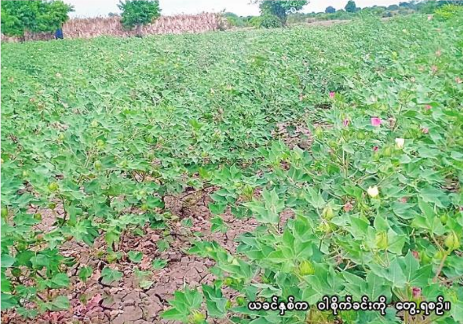
ယခုနှစ်က ဝါစိုက်ခင်းကို တွေ့ရစဉ်။

စစ်ကိုင်း၊ ဩဂုတ် ၈ စစ်ကိုင်းတိုင်းဒေသကြီး၊ စစ်ကိုင်းခရိုင် မြင်းမူမြို့နယ်တွင် ယခုနှစ် မိုးသီးနှံစိုက်ပျိုးရာသီ၌ ဝါ ၁၄၃၈ ကေ စိုက်ပျိုးပြီးစီးပြီဖြစ်ကြောင်း စစ်ကိုင်းခရိုင် စိုက်ပျိုးရေးဦးစီးဌာနမှ သိရသည်။ မြင်းမူမြို့နယ်တွင် ယခုနှစ် မိုးသီးနှံစိုက်ပျိုးရာသီ၌ ဝါ ၂၀၂၃၂ ကေ စိုက်ပျိုးရန်လျာထားပြီး ယခုနှစ် မေလမှစတင် စိုက်ပျိုးခဲ့ရာ ယနေ့ထိ ၁၄၃၈ ကေစိုက်ပျိုးပြီးစီးပြီဖြစ်ကြောင်း သိရသည်။