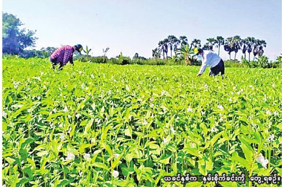
ယခင်နှစ်က ရှမ်းစိုက်ခင်းကို တွေ့ရစဉ်။