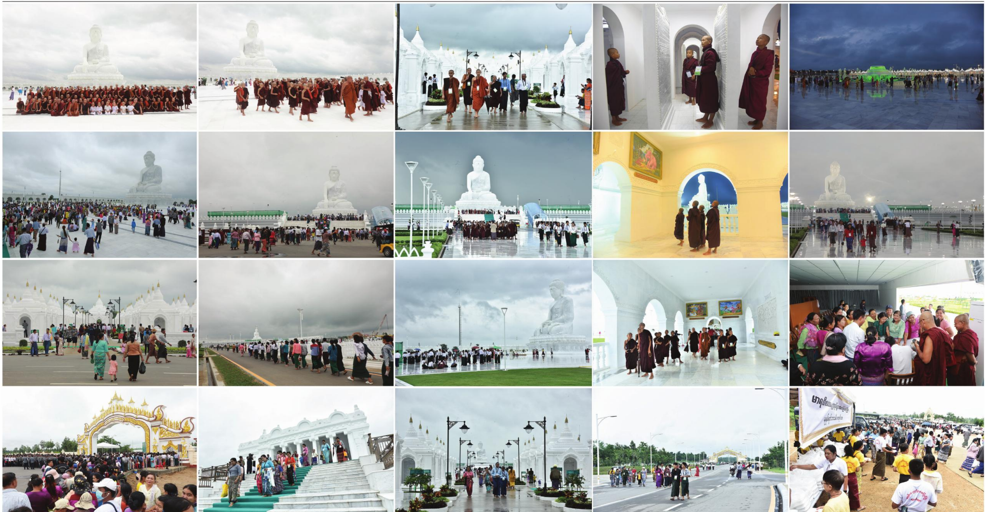
ပြည်ထောင်စုနယ်မြေ ခေပြည်တော် ဒဂုံအင်္ဂါရုံ၊ နယ်မြေ ဗုဒ္ဓဥယျာဉ်တော်တွင် တည်ထားပူဇော်ဆောင်ရွက်ခဲ့သည့် ကမ္ဘာပေါ်ရှိ ထိုင်တော်မူကျောက်စာစီရင်စွန့်ပေးတော်မူသည့် ဣန္ဒြေအား အနယ်နယ်အရပ်ရပ်မှ လာရောက်ပူးပေါင်းကြည့်ရှုနိုင်ခဲ့သည့် ရဟန်းရှင်လူထုများလည်း နေရာတော်များတွင် ဆွဲကြည့်ရှုနိုင်ခဲ့ကြောင်း ဖော်ပြပေးရမည်။

ကျောက်စာစီရင်စွန့်ပေးတော်မူသည့် ဣန္ဒြေအား အနယ်နယ်အရပ်ရပ်မှ လာရောက်ပူးပေါင်းကြည့်ရှုနိုင်ခဲ့သည့် ရဟန်းရှင်လူထုများလည်း နေရာတော်များတွင် ဆွဲကြည့်ရှုနိုင်ခဲ့ကြောင်း ဖော်ပြပေးရမည်။