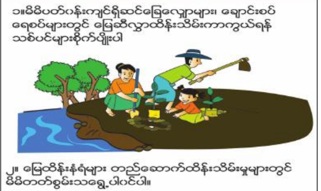
၁။ မိမိပတ်ဝန်းကျင်ရှိ ဆင်ခြေလျှော့များ၊ ချောင်းစပ်ရေစပ်များတွင် မြေဆီလွှာထိန်းသိမ်းကာကွယ်ရန် သစ်ပင်များစိုက်ပျိုးပါ။