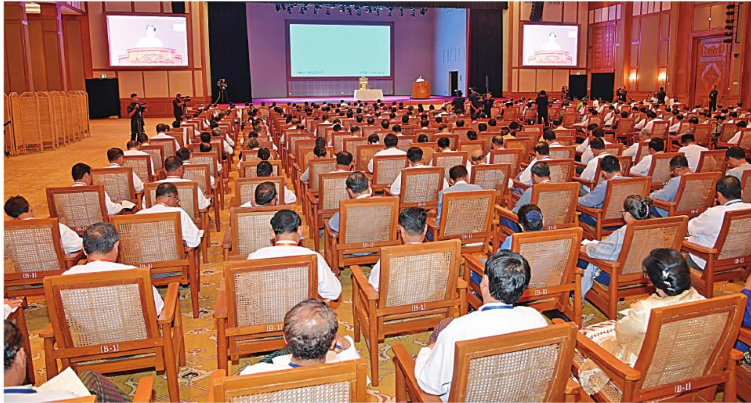
နိုင်ငံတော်စီမံအုပ်ချုပ်ရေးကောင်စီဥက္ကဋ္ဌ နိုင်ငံတော်ဝန်ကြီးချုပ် ဗိုလ်ချုပ်မှူးကြီးမင်းအောင်လှိုင် ပြည်ထောင်စုအဆင့်ပုဂ္ဂိုလ်များနှင့် ပြည်ထောင်စုဝန်ကြီးဌာနများမှ တာဝန်ရှိသူများကို တွေ့ဆုံအမှာစကားပြောကြားစဉ်။

၂။ ရှေ့မှူးအဆက် ထိုသို့ တွေ့ဆုံစဉ် နိုင်ငံတော်စီမံအုပ်ချုပ်ရေးကောင်စီဥက္ကဋ္ဌ နိုင်ငံတော်ဝန်ကြီးချုပ်က အမှာစကားပြောကြားရာ၌ နိုင်ငံတော်၏အခြေအနေအရ သက်တမ်းထပ်မံတိုးမြှင့်သည့် ကာလအတွင်း ဆောင်ရွက်ရမည့် လုပ်ငန်းများနှင့် ဆောင်ရွက်သင့်သည်များကို မှာကြားလိုခြင်းကြောင့် ယခုကဲ့သို့ တွေ့ဆုံရခြင်းဖြစ်ကြောင်း၊ အသစ်ထပ်မံချမှတ်ထားသည့် ရွေ့လုပ်ငန်းစဉ်များနှင့် ဦးတည်ချက်များကိုလည်း ထုတ်ပြန်ပေးသွားမည်ဖြစ်ကြောင်း၊ ရွေ့လုပ်ငန်းစဉ်များနှင့် ဦးတည်ချက်များကို အကောင်အထည်ဖော်ဆောင်ရွက်ရန်မှာ အစိုးရ၏တာဝန်ဖြစ်ကြောင်း၊ နိုင်ငံတော်၏တာဝန်ကို ထမ်းဆောင်သည့် မည်သည့်အစိုးရမဆို နိုင်ငံကောင်းအောင် ဆောင်ရွက်ရမည် တာဝန်ရှိကြောင်း။ မိမိတို့အစိုးရ၏ နိုင်ငံရေးရည်မှန်းချက် နှစ်ရပ်မှာ စစ်မှန်စည်းကမ်းပြည့်ဝသည့် ပါတီစုံဒီမိုကရေစီစနစ်ခိုင်မာစေရေး၊ ဒီမိုကရေစီနှင့် ဖက်ဒရယ်စနစ်ကိုအခြေခံသည့် ပြည်ထောင်စုတည်ဆောက်ရေးနှင့် အမျိုးသားရေးရည်မှန်းချက်နှစ်ရပ်မှာ တိုင်းပြည်သာယာပြောရေး၊ စာရေးရိက္ခာဖူလုံရေး တို့ပင်ဖြစ်ပြီး တိုင်းပြည်သာယာပြောရေး၌ ပြည်သူပြည်သားများအားလုံး အေးအေးချမ်းချမ်းဖြင့် နေထိုင်လုပ်ကိုင်စားသောက်နိုင်ရမည်။ ပညာသင်ကြားနိုင်ရမည်ဖြစ်ကြောင်း၊ လူတိုင်းသည် အေးချမ်းစွာ နေထိုင်လုပ်ကိုင်စားသောက်လိုကြပြီး မိမိတို့ဘဝတိုးတက်ရေးအတွက် ရည်မှန်းချက်၊ မျှော်မှန်းချက်များ ကိုယ်စီရှိကြကာ အေးချမ်းလုံခြုံစိတ်ချစွာဖြင့် နေထိုင်လုပ်ကိုင် စားသောက်လိုကြကြောင်း၊ ထို့ကြောင့် တည်ငြိမ်အေးချမ်းမှုကို ဆောင်ရွက်ပေးရန်လိုကြောင်း၊ စားရေးရိက္ခာသည် လူတိုင်းအတွက်လိုအပ်ပြီး လက်ရှိတက္ကသိုလ်တွင်လည်း စားနပ်ရိက္ခာလုံခြုံရေး (Food Security) မှာ အကြီးမားဆုံးစိန်ခေါ်မှုဖြစ်နေကြောင်း၊ မိမိတို့ နိုင်ငံအနေဖြင့်လည်း စားနပ်ရိက္ခာလုံခြုံရေး