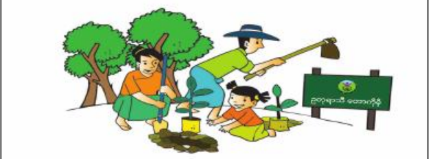
၅။ သစ်တောထိန်းသိမ်းခြင်းလုပ်ငန်းများတွင် အစိုးရရရှိသည့် အစည်းအဝေးများနှင့် အတူပူးပေါင်းဆောင်ရွက်ပါ။