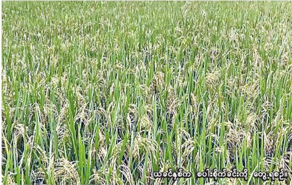
ယခုနှစ်က စပါးစိုက်ခင်းကို တွေ့ရစဉ်။

မော်လိုက် ဩဂုတ် ၈ စစ်ကိုင်းတိုင်းဒေသကြီး မော်လိုက်ခရိုင် မော်လိုက်မြို့နယ်တွင် ယခုနှစ် မိုးသီးနှံစိုက်ပျိုးရာသီ၌ မိုးစပါး ၆၁၃၇ ဧကစိုက်ပျိုးပြီးစီး ပြီးဖြစ်ကြောင်း မော်လိုက်ခရိုင် စိုက်ပျိုးရေးဦးစီးဌာနမှ သိရသည်။ မော်လိုက်မြို့နယ်တွင် ယခုနှစ် မိုးသီးနှံစိုက်ပျိုးရာသီ၌ မိုးစပါး