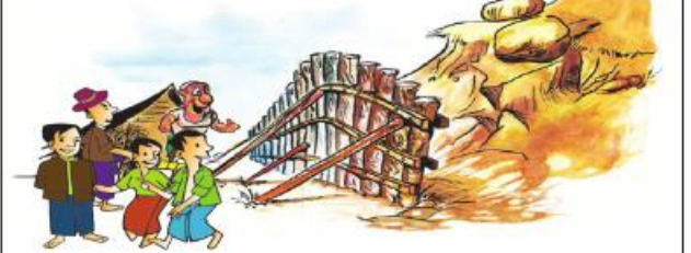
၃။ ရွှေ့ပြောင်းတောင်ယာစနစ်အစား လှေကားထစ်စိုက်ပျိုးရေးစနစ်ကို ကျင့်သုံးပါ။