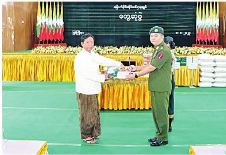
မြောက်ပိုင်းတိုင်းစစ်ဌာနချုပ် တိုင်းမှူး၊ ဗိုလ်မှူးချုပ်စိုးလှိုင် စစ်မှုထမ်းဟောင်းအဖွဲ့ဝင်များအတွက် စားသောက်ဖွယ်ရာများ၊ ဂုဏ်ပြုချီးမြှင့်ငွေများနှင့် သူတ၊ ရသစာအုပ်၊ စာစောင်များ ပေးအပ်စဉ်။

နေပြည်တော် ဩဂုတ် ၈ - တိုင်းစစ်ဌာနချုပ် ဗလမင်းထင်ခန်းမ၌ မြစ်ကြီးနားမြို့နယ် စစ်မှုထမ်းဟောင်း အဖွဲ့ဝင်များနှင့် ပြည်သူ့စစ်(ဌာနေ)တပ်ဖွဲ့ ဝင်များ တွေ့ဆုံပွဲကို ယနေ့မနက် ၉ နာရီခွဲတွင် မြောက်ပိုင်းတိုင်းစစ်ဌာနချုပ် တိုင်းမှူး ဗိုလ်မှူးချုပ်စိုးလှိုင်နှင့် အဖွဲ့ဝင် များ၊ စစ်မှုထမ်းဟောင်းအဖွဲ့ဝင်များ