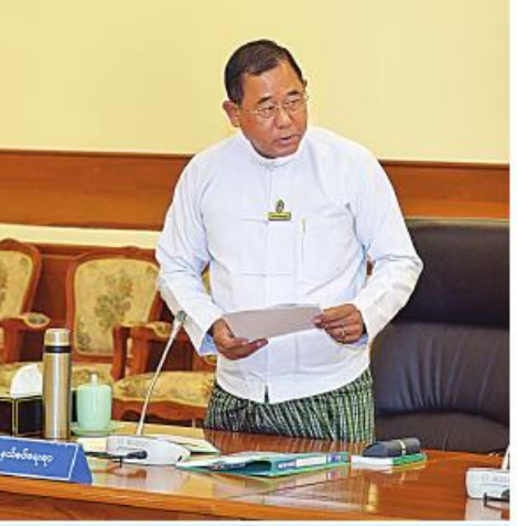
နယ်စပ်ရေးရာဝန်ကြီးဌာန ပြည်ထောင်စုဝန်ကြီး ဒုတိယဝိုလ်ချုပ်ကြီးထွန်းထွန်းနောင် ဆွေးနွေးတင်ပြစဉ်။

ညှိနှိုင်းဆောင်ရွက်ပေးခဲ့သည်ကို ထည့်သွင်းပြောကြားလိုပါကြောင်း။ မိမိတို့အစိုးရအနေဖြင့် လယ်ယာစီးပွားမြှင့်တင်ရေးနှင့် ပြည်နယ်နှင့် တိုင်းဒေသကြီး၊ ကိုယ်ပိုင်အုပ်ချုပ်ခွင့်ရဒေသများ၏ စီးပွားရေးမြှင့်တင်ရေး ဆိုပြီး နှစ်မျိုးခွဲမြဲတင်ရန် စဉ်းစားဆောင်ရွက်ခဲ့ပါကြောင်း၊ အမျိုးသား သဘာဝဘေးအန္တရာယ်ဆိုင်ရာ စီမံခန့်ခွဲမှုရန်ပုံငွေမှကျပ်ဘီလီယံ ၄၀၀ ကို နိုင်ငံစီးပွားရေးဖွံ့ဖြိုးတိုးတက်ရေးအတွက် သီးသန့်ရန်ပုံငွေတစ်ရပ်ထူထောင် ပြီး နိုင်ငံစီးပွားရေးမြှင့်တင်နိုင်ရန် စီမံဆောင်ရွက်ခဲ့ပါကြောင်း၊ ထို့ပြင် အနာဂတ် MSME လုပ်ငန်းများတွင် ပိုမိုတိုးတက်လာစေရန်အတွက် ရည်ရွယ်ပြီး ၂၀၂၃-၂၀၂၄ ပညာသင်နှစ်မှစ၍ ခရိုင် ၅၀ ၌ စက်မှု၊ စိုက်ပျိုး၊ မွေးမြူရေးအထက်တန်းကျောင်း ၅၁ ကျောင်းကို ဖွင့်လှစ်ပေးပြီး ဖြစ်သကဲ့သို့ လာမည့် ၂၀၂၄-၂၀၂၅ ပညာသင်နှစ်တွင် ကျန်ခရိုင် ၇၅ ခုတွင် ကျောင်းများဆက်လက်ဖွင့်လှစ်သွားရန် စီမံဆောင်ရွက်ထားပြီး ဖြစ်ပါကြောင်း။ မိမိတို့အနေဖြင့် စီးပွားရေးအရ ဘက်စုံတိုးတက်မှုများရရှိလာစေရေး အတွက် ဦးတည်ချက်၊ ရည်မှန်းချက်များကိုချမှတ်ပြီး အကောင်အထည် ဖော်ဆောင်ရွက်ခဲ့သည့်အတွက် ၂၀၂၀-၂၀၂၁ ခုနှစ်တွင် ကျဆင်းခဲ့သည့် စီးပွားရေးအခြေအနေမှ ရုန်းထွက်လာနိုင်ခဲ့ပြီးဖြစ်ပါကြောင်း၊ ၂၀၂၂-၂၀၂၃ ဘဏ္ဍာနှစ်တွင် GDP တိုးတက်မှု ၃ ဒသမ ၄ ရာခိုင်နှုန်းရရှိခဲ့ပြီး ၂၀၂၃-၂၀၂၄ ဘဏ္ဍာနှစ်တွင် GDP ၄ ရာခိုင်နှုန်းခန့်အထိတိုးတက်မည်