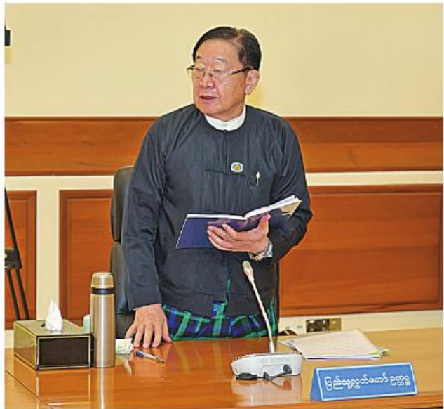
ပြည်ထောင်စုသမ္မတမြန်မာနိုင်ငံတော် အမျိုးသားကာကွယ်ရေးနှင့် လုံခြုံရေးကောင်စီအစည်းအဝေး(၂/၂၀၂၃)တွင် ပြည်သူ့လွှတ်တော်ဥက္ကဋ္ဌ ဦးတီခွန်မြတ် ဆွေးနွေးစဉ်။

လျက်ရှိသည့် လုပ်သားများကို ပစ်ခတ်တိုက်ခိုက်ခြင်း စသည်များကို လုပ်ဆောင်ခဲ့သည်အတွက် လုံခြုံရေးတပ်ဖွဲ့ဝင်အချို့၊ ဝန်ထမ်းအချို့နှင့် အပြစ်မဲ့ပြည်သူများ သေကျေဒဏ်ရာရရှိမှုဖြစ်စဉ်များလည်း ဖြစ်ပွားခဲ့ပါကြောင်း၊ ထို့ပြင် ဇူလိုင် ၁၈ ရက်တွင် ပဲခူးတိုင်းဒေသကြီး ကျောက်တံခါးမြို့နယ်အတွင်းရှိ ကျောက်တံခါးဘူတာနှင့် ပဲခူးကုန်းဘူတာအကြား မိုင်းတိုင်အမှတ် (၁၀၉/၂၀ -၂၀)အနီးရှိ ရထားသံလမ်းကို ဖျက်ဆီးမှုများ လုပ်ဆောင်ခဲ့သည်အတွက် ရထားခရီးစဉ်များကိုဖျက်ဆီးပြီး ပြန်လည်ပြုပြင်ရေးလုပ်ငန်းများကို ဆောင်ရွက်ခဲ့ရပါကြောင်း၊ ၂၀၂၃ ခုနှစ် ဇူလိုင် ၂၈ ရက်တွင် မန္တလေးတိုင်းဒေသကြီး စဉ့်ကိုင်မြို့နယ် ပလိပ်ဘူတာနှင့် စဉ့်ကိုင်ဘူတာကြား ရထားလမ်းပိုင်းပေါ်ရှိ ရထားသံလမ်းဆက်ပြားများနှင့် သံလမ်းဆက်မူလများကို အကြမ်းဖက်ဖျက်သမားများက ဖျက်ယူဖျက်ဆီး