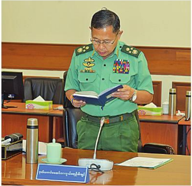
ပြည်ထောင်စုသမ္မတမြန်မာနိုင်ငံတော် အမျိုးသားကာကွယ်ရေးနှင့် လုံခြုံရေးကောင်စီအစည်းအဝေး (၂/၂၀၂၃)တွင် ဒုတိယတပ်မတော် ကာကွယ်ရေးဦးစီးချုပ် ကာကွယ်ရေးဦးစီးချုပ်ကြီး (ကြည်း) ဒုတိယ ဝိုလ်ချုပ်မှူးကြီး ခိုင်းဆွေတင်ပြစဉ်။

မိမိတို့အစိုးရအနေဖြင့် ပြည်သူ့လူမှုစီးပွားဘဏ္ဍာဖွံ့ဖြိုးတိုးတက်ရေး အတွက်လည်း ကြိုးစားဆောင်ရွက်လျက်ရှိပါကြောင်း၊ နိုင်ငံတစ်ခုတွင် စီးပွားရေးမောင်းနှင်အား၊ နိုင်ငံရေးမောင်းနှင်အားနှင့် ကာကွယ်ရေး မောင်းနှင်အား ကောင်းမွန်နေရန်လိုပါကြောင်း၊ စီးပွားရေးမောင်းနှင်အား ကောင်းမွန်လာသည်နှင့်အမျှ နိုင်ငံရေးနှင့် ကာကွယ်ရေးစွမ်းအားများသည် လည်း ကောင်းမွန်လာမည်ဖြစ်ပြီး အင်အားကောင်းသည် နိုင်ငံတစ်ခုဖြစ် လာမည်ဖြစ်ပါကြောင်း၊ မိမိတို့နိုင်ငံအတွက် သေချာခိုင်မာသည့် စီးပွားရေး လုပ်ငန်းနှင့် ကုန်ထုတ်လုပ်မှုသည် နိုက်ပျိုးမွေးမြူရေးလုပ်ငန်းပင်ဖြစ်ပါ ကြောင်း၊ အဆိုပါနိုက်ပျိုးမွေးမြူရေးလုပ်ငန်းကိုအခြေခံသည့် MSME စက်မှုလုပ်ငန်းများကို အားပေးဆောင်ရွက်သွားရန်လိုအပ်ပါကြောင်း၊ အဆိုပါစီးပွားရေးလုပ်ငန်းများသည် ပြည်သူ့တစ်ရပ်လုံးအတွက် အကျိုးဝင် သည့်လုပ်ငန်းများဖြစ်သဖြင့် နိုင်ငံတော်ဖွံ့ဖြိုးတိုးတက်ရန်အတွက် အဓိကကျ ပြီး အချိန်တိုအတွင်း အကျိုးဖြစ်ထွန်းနိုင်သည့်အတွက် အားပေးမြှင့်တင် ဆောင်ရွက်ရမည်ဖြစ်ပါကြောင်း၊ ထို့ကြောင့် မိမိအပါအဝင် နိုင်ငံတော်စီမံ အုပ်ချုပ်ရေးကောင်စီ ဒုတိယဥက္ကဋ္ဌတို့သည် တိုင်းဒေသကြီးနှင့် ပြည်နယ် အသီးသီးက ဒေသ ၂၆ ခုတွင်ရှိသည့် MSME လုပ်ငန်းရှင်များနှင့် ၂၆ ကြိမ်တွေ့ဆုံဆွေးနွေးနိုင်ခဲ့ပြီး တင်ပြချက် ၂၃၀ ကျော်ကိုလည်း ပေါင်းစပ်