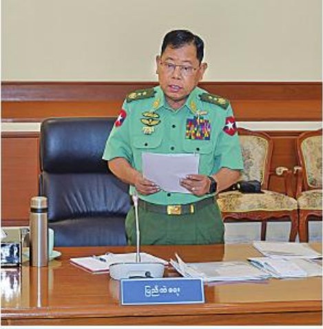
ပြည်ထောင်စုဝန်ကြီးဌာန ပြည်ထောင်စုဝန်ကြီး ဒုတိယဝိုလ်ချုပ်ကြီး ခိုင်းဆွေ တင်ပြစဉ်။