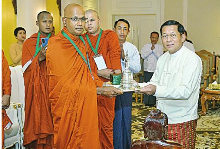
သီရိလင်္ကာနိုင်ငံမှ ဆရာတော်ကြီးများက ဦးဆောင်ဘုရားဒါယကာ နိုင်ငံတော်စီမံအုပ်ချုပ်ရေးကောင်စီဥက္ကဋ္ဌ နိုင်ငံတော်ဝန်ကြီးချုပ် ဝိုလ်ချုပ်မှူးကြီးမင်းအောင်လှိုင် အား ဓမ္မလက်ဆောင်များ ပေးအပ်စဉ်။