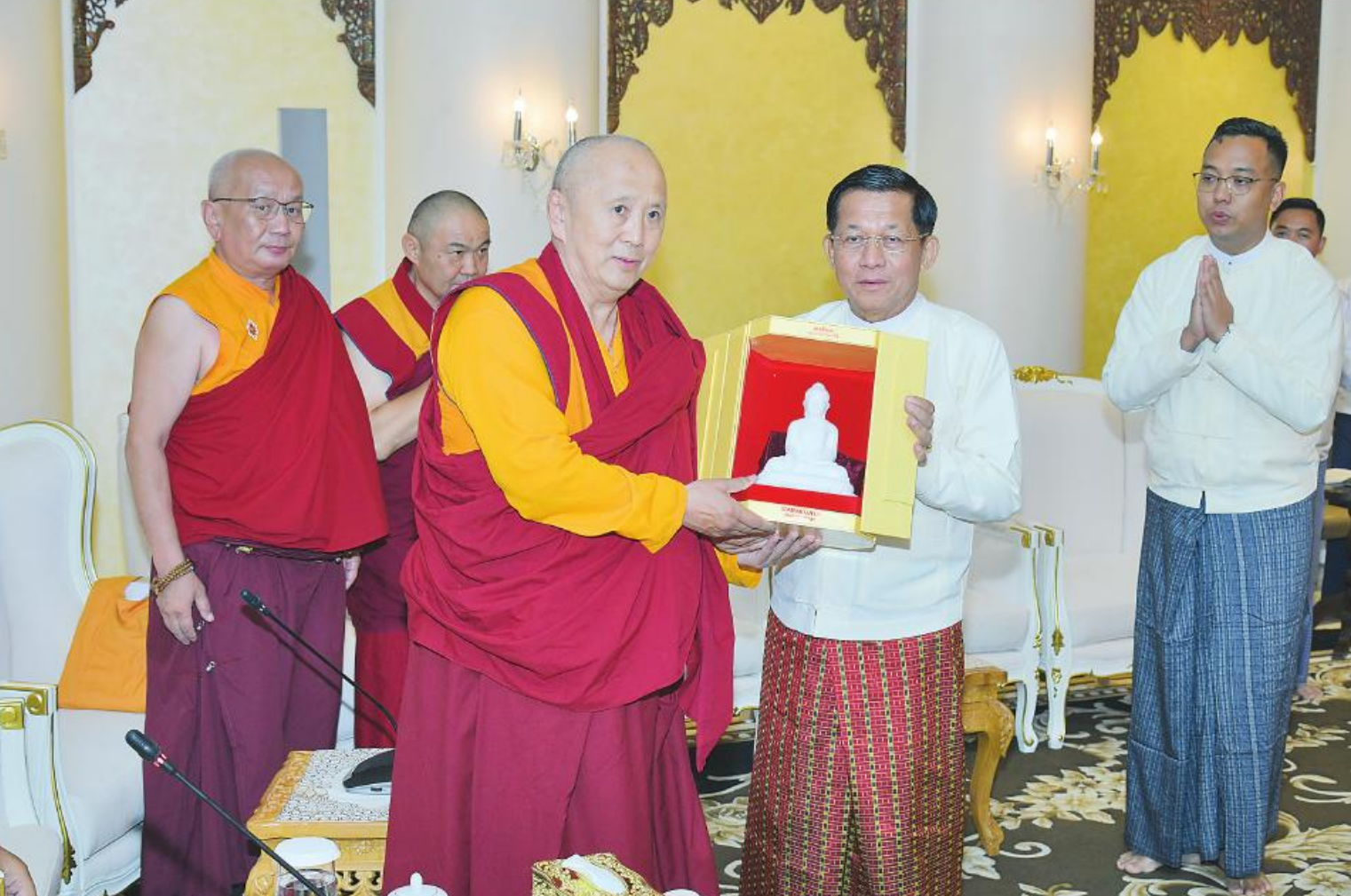
နေပြည်တော် ဇူလိုင် ၃၁ ပြည်ထောင်စုနယ်မြေ နေပြည်တော် ဒေသကထိရိမြို့နယ်အတွင်း တည်ထားကိုးကွယ်လျက်ရှိသည့် ကမ္ဘာပေါ်ရှိ ထိုင်တော်မူကျောက်ဆစ်ဗုဒ္ဓရုပ်ပွားတော်များအနက် ဉာဏ်တော်အမြင့်ဆုံးဖြစ်လာမည့် မာရဝိဇယဗုဒ္ဓရုပ်ပွားတော်မြတ်ကြီး ပုဒ္ဓါဘိသေကအနေကဇာတင်လှူခြင်း၊ ကျောက်စာရုံစေတီများ ထီးတော်တင်လှူခြင်းနှင့် ရေစက်ချခြင်း စသည့် မဟာမင်္ဂလာအခမ်းအနားများကို မြန်မာသက္ကရာဇ် ၁၃၈၅ ခုနှစ် ဒုတိယဝါဆိုလပြည့် (ဓမ္မစကြာနေ့) ခရစ်နှစ် ၂၀၂၃ ခုနှစ် ဩဂုတ် ၁ ရက်တွင် နိုင်ငံတော်အဆင့် စည်ကားသိုက်မြိုက်စွာ စာမျက်နှာ ၁၆ ကော်လံ ၁ ။ ရဟန်းမင်းအေးရင်းနိုင်ငံမှ ဆရာတော်ကြီးထံ ဦးဆောင်ဘုရားဒါယကာ နိုင်ငံတော် စီမံအုပ်ချုပ်ရေးကောင်စီဥက္ကဋ္ဌ နိုင်ငံတော်ဝန်ကြီးချုပ် ဗိုလ်ချုပ်မှူးကြီး မင်းအောင်လှိုင်က မာရဝိဇယဗုဒ္ဓရုပ်ပွားတော်မြတ် ပုံစံတူကျောက်ဆစ် ဗုဒ္ဓရုပ်ပွားတော်မြတ်ကို ဆက်ကပ်လှူဒါန်းစဉ်။