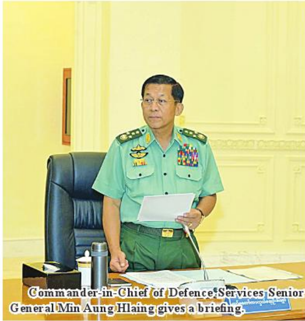
Commander-in-Chief of Defence Services Senior General Min Aung Hlaing gives a briefing.