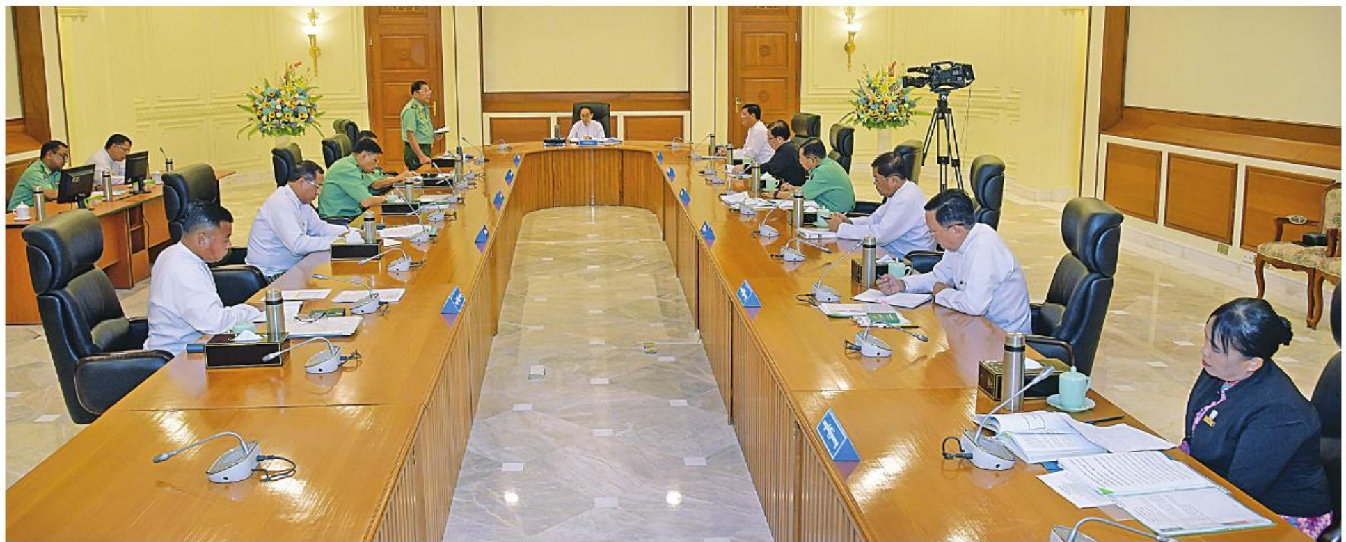
ပြည်ထောင်စုသမ္မတမြန်မာနိုင်ငံတော် အမျိုးသားကာကွယ်ရေးနှင့်လုံခြုံရေးကောင်စီအစည်းအဝေး(၂/၂၀၂၃) ကျင်းပစဉ်။ (သတင်း စာမျက်နှာ-၁၉)