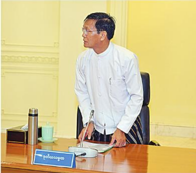
ပြည်ထောင်စုသမ္မတမြန်မာနိုင်ငံတော် အမျိုးသားကာကွယ်ရေးနှင့် လုံခြုံရေးကောင်စီအစည်းအဝေး(၂/၂၀၂၃)တွင် ဒုတိယသမ္မတ ဦးဟင်နရီဝန်ထီးယျ ဆွေးနွေးစဉ်။

၂၀၂၃-၂၀၂၄ ပညာသင်နှစ်အတွက် အခြေခံပညာကျောင်းများ စတင်ဖွင့်လှစ်ချိန်တွင် ကျောင်းသား၊ ကျောင်းသူများ ကျောင်းမတက်စေရေး