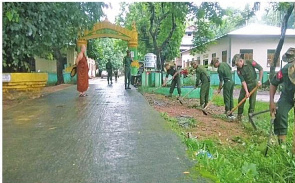
ဧရာဝတီတိုင်းဒေသကြီး ကွင်းကောက်မြို့ ကျွန်းခြားကျောင်းတိုက်၌ နယ်မြေခံတပ်မတော်သားများက စုပေါင်းသန့်ရှင်းရေး ဆောင်ရွက်ကြစဉ်။