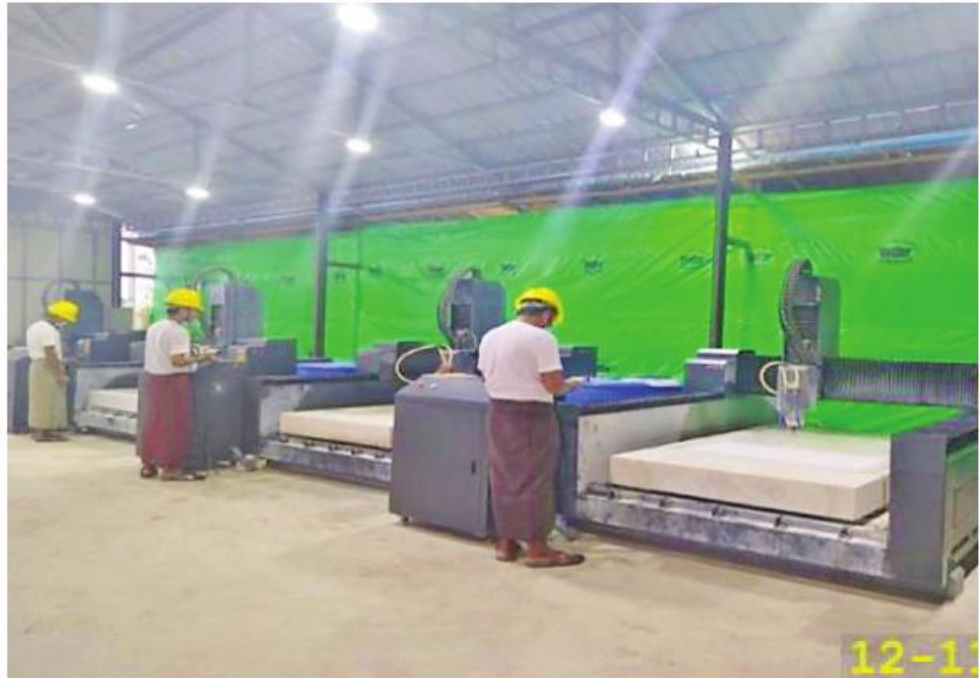
ကျောက်စာရေးထွင်းခြင်းနှင့် ကျောက်စာရုံအတွင်းသို့ ကျောက်စာချပ်များ ထည့်သွင်းပြီးစီးပုံကိုတွေ့ရစဉ်။