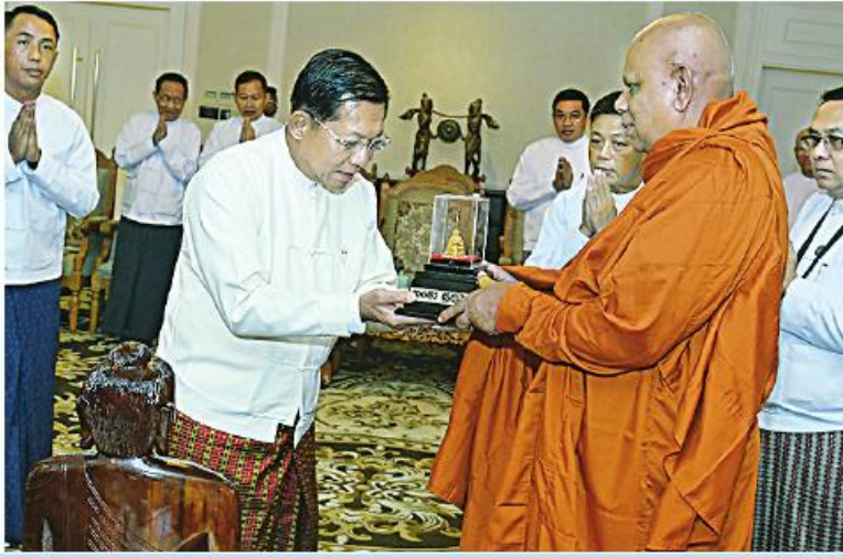
သီရိလင်္ကာနိုင်ငံမှ ဆရာတော်ကြီးများက ဦးဆောင်ဘုရားဒါယကာ နိုင်ငံတော်စီမံအုပ်ချုပ်ရေးကောင်စီဥက္ကဋ္ဌ နိုင်ငံတော်ဝန်ကြီးချုပ် ဝိုလ်ချုပ်မှူးကြီးမင်းအောင်လှိုင် အား ဓမ္မလက်ဆောင်များ ပေးအပ်စဉ်။