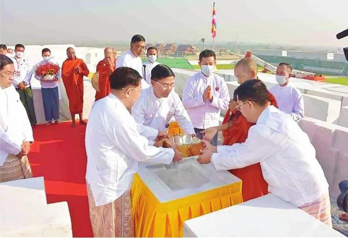
ရတနာပလ္လင်တော်ထက်တွင် ဌာပနာထည့်သွင်းပူဇော်ခြင်းမဟာမင်္ဂလာအခမ်းအနား ကျင်းပနေမှုကိုတွေ့ရစဉ်။

ဖေဖော်ဝါရီ ၁၀ ရက်နေ့တွင်လည်း နိုင်ငံတစ်ဝန်းလုံးရှိ ခုနစ်ရက်သား၊ သမီး၊ ဘုရားဒါယကာ၊ ဒါယိကာမများ၊ စေတနာရှင် အလှူရှင်များက ပြည်ထောင်စုနယ်မြေ နေပြည်တော်အပါအဝင် တိုင်းဒေသကြီး နှင့် ပြည်နယ်အသီးသီးမှလာရောက်လှူဒါန်း ခဲ့ကြသည့် ရွှေထည် ၁၃၆၀ ကျပ်သား၊ ၅ ဒသမ ၄ ရွှေ၊ ကျောက်မျက်ရတနာပါ