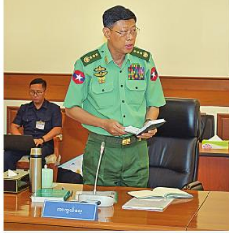
ကာကွယ်ရေးဝန်ကြီးဌာန ပြည်ထောင်စုဝန်ကြီး ဝိုလ်ချုပ်ကြီးမြထွန်းဦး ဆွေးနွေးတင်ပြစဉ်။

မိမိတို့နိုင်ငံတွင်နေထိုင်သည့် တိုင်းရင်းသားများအနေဖြင့် မိမိတို့၏ ဆန္ဒနှင့်လိုလားချက်များကို လက်နက်ကိုင်တောင်းဆိုနေ၍ မရဘဲ ဒီမိုကရေစီ စနစ်နှင့်အညီ ပေါင်းစပ်ညှိနှိုင်းပြီး ဆွေးနွေးဆုံးဖြတ်ဆောင်ရွက်သွားကြ ရမည်ဖြစ်ပါကြောင်း၊ ထို့ကြောင့် နိုင်ငံရေးစင်မြင့်မြင့်ဖြစ်သည့် လွှတ်တော်ထဲကို တိုင်းရင်းသားကိုယ်စားလှယ်များ စုံစုံညီညီရောက်ရှိပြီး လိုလားချက်များ၊ ရည်မှန်းချက်များကို လွှတ်တော်အသီးသီးတွင် ပွင့်လင်းမြင်သာစွာ ဆွေးနွေး၊ ဆုံးဖြတ်၊ အကောင်အထည်ဖော်နိုင်ရန် အရေးကြီးပါကြောင်း၊ ထို့ကြောင့် တိုင်းရင်းသားလက်နက်ကိုင်များကို လက်နက်ကိုင်လမ်းကြောင်းမှ နိုင်ငံရေး စင်မြင့်ပေါ်တက်ရောက်လာနိုင်ရေးအတွက် တစ်နိုင်ငံလုံးပစ်ခတ်တိုက်ခိုက် မှုရပ်စဲရေးသဘောတူစာချုပ်(NCA)ကို အလေးထားအကောင်အထည်ဖော် ခဲ့ခြင်းဖြစ်ပါကြောင်း၊ တစ်နိုင်ငံလုံးပစ်ခတ်တိုက်ခိုက်မှုရပ်စဲရေးသဘောတူ စာချုပ်(NCA)သည် အစိုးရနှင့် EAO များအကြား၊ နိုင်ငံတကာအဖွဲ့ အစည်းများအကြားထားရှိခဲ့သည့် ကတိကဝတ်များပင်ဖြစ်ပါကြောင်း၊ အမျိုးသားစည်းလုံးညီညွတ်ရေးနှင့် ငြိမ်းချမ်းရေးဖော်ဆောင်မှု ညှိနှိုင်းရေး ကော်မတီသည် ၂၀၂၃ ခုနှစ် ဖေဖော်ဝါရီ ၁ ရက်မှ ဇူလိုင် ၂၇ ရက်အထိ NCA လက်မှတ်ရေးထိုးထားသည့်အဖွဲ့ ၅ ခုနှင့်၊ လက်မှတ်ရေးထိုးထား ခြင်းမရှိသည့်အဖွဲ့ သုံးဖွဲ့တို့နှင့် ငြိမ်းချမ်းရေးဆွေးနွေးပွဲပေါင်း ၂၂ ကြိမ်