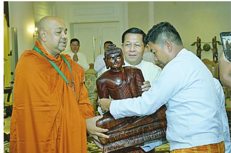
သီရိလင်္ကာနိုင်ငံမှ ဆရာတော်ကြီးထံ ဦးဆောင်ဘုရားဒါယကာ နိုင်ငံတော်စီမံ အုပ်ချုပ်ရေးကောင်စီဥက္ကဋ္ဌ နိုင်ငံတော်ဝန်ကြီးချုပ် ဝိုလ်ချုပ်မှူးကြီးမင်းအောင်လှိုင်က မာရဝိဇယဗုဒ္ဓရုပ်ပွားတော်မြတ်ပုံစံတူ ကျောက်ဆစ်ဗုဒ္ဓရုပ်ပွားတော်မြတ်ကို ဆက်ကပ် လှူဒါန်းစဉ်။