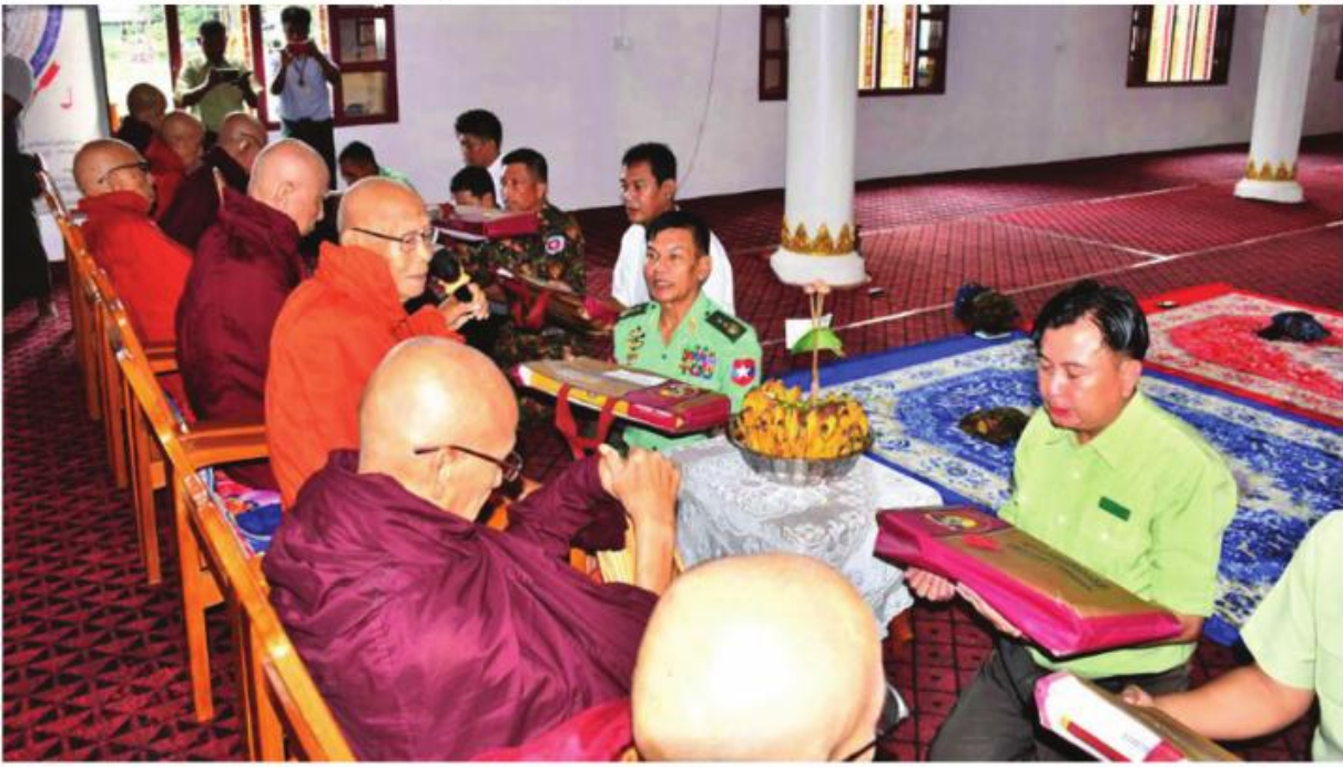
ဆရာတော်၊ သံဃာတော်များထံ ကာကွယ်ရေးဦးစီးချုပ်ရုံး(ကြည်း)မှ ဒုတိယဗိုလ်ချုပ်ကြီးလူအေးနှင့် ဌာနဆိုင်ရာတာဝန်ရှိသူများက ဝါဆိုသင်္ကန်း၊ ဆွမ်းဆန်တော်၊ ဆီ၊ ဆေးဝါးများနှင့် နဝကမ္မအလှူတော်ငွေများ ဆက်ကပ်လှူဒါန်းစဉ်။

နေပြည်တော် ဇူလိုင် ၃၁ - ဒုတိယဗိုလ်ချုပ်ကြီးလူအေးသည် ဌာနဆိုင်ရာတာဝန်ရှိသူများနှင့်အတူ ဆိုင်ကလုန်းမုန်တိုင်း(မိုခါ) တိုက်ခတ်မှုကြောင့် ထိခိုက်ပျက်စီးခဲ့သည့် ဒေသများတွင် ပြန်လည်ထူထောင်ရေးလုပ်ငန်းများ ဆောင်ရွက်နိုင်ရန် ဒေသအလိုက် တပ်မတော်အရာရှိကြီးများကို တာဝန်ပေးအပ်ထားရှိရာ ယနေ့တွင် ရခိုင်ပြည်နယ် ကျောက်ဖြူမြို့သို့ရောက်ရှိနေသော ကာကွယ်ရေးဦးစီးချုပ်ရုံး(ကြည်း)မှ ဖမ်းဆီးရမည့် ပစ္စည်းများနှင့်အတူ တပ်မတော်သားများနှင့် ဌာနဆိုင်ရာ ဝန်ထမ်းများ စုပေါင်းသန့်ရှင်းရေးလုပ်ငန်းများ ဆောင်ရွက်ပေးနေမှုများကို သွားရောက်ကြည့်ရှုအားပေးပြီး လိုအပ်သည်များ ညှိနှိုင်းဆောင်ရွက်ပေးခဲ့ကြောင်း သတင်းရရှိသည်။ ယင်းနောက် မြို့အဝင်ပွိုင့်ကမ်းခြေ