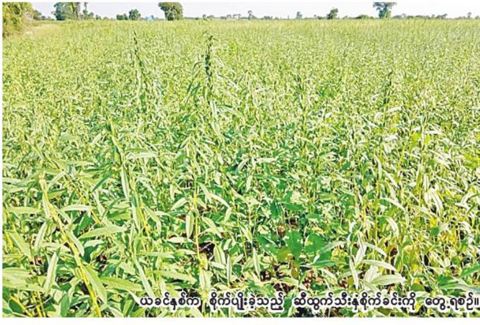
ယခင်နှစ်က စိုက်ပျိုးခဲ့သည့် ဆီထွက်သီးနှံစိုက်ခင်းကို တွေ့ရစဉ်။

ရေးဦးစီးဌာန၏ စာရင်းများအရ သိရသည်။ မြင်းမူမြို့နယ်တွင် ယခုနှစ် ဆီထွက်သီးနှံစိုက်ပျိုးတောင်သူများကို မြို့နယ်စိုက်ပျိုးရေးဦးစီးဌာန အနေဖြင့် မျိုးကောင်းမျိုးသန့်များ စိုက်ပျိုးရန်၊ သီးထပ်သီးညှပ်များဖြင့် ဆီထွက်သီးနှံများကို စိုက်ပျိုးထုတ်လုပ်ရန်အတွက် နည်းပညာများ ဆောင်ရွက်ပေးလျက်ရှိကြောင်း သိရသည်။ (၂၀၆)