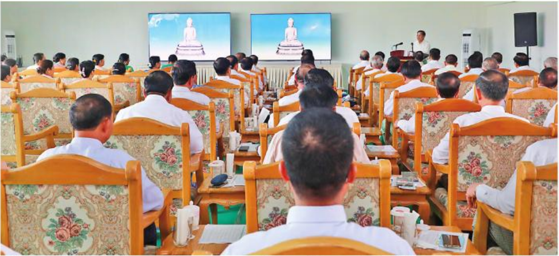
ဦးဆောင်ဘုရားဒါယကာ နိုင်ငံတော်စီမံအုပ်ချုပ်ရေးကောင်စီဥက္ကဋ္ဌ နိုင်ငံတော်ဝန်ကြီးချုပ် ဗိုလ်ချုပ်မှူးကြီးမင်းအောင်လှိုင်က မတည်အလှူငွေများစုပေါင်းလှူဒါန်းကြခြင်းအပေါ် ကျေးဇူးတင်စကားပြန်လည်ပြောကြားစဉ်။

လှူဒါန်းသည့်သာသနိကအဆောက်အအုံ၊ လှူဒါန်းငွေများနှင့်အတူဖော်ပြပေးလျက် ရှိပါသည်။ နိုင်ငံတော်စီမံအုပ်ချုပ်ရေးကောင်စီ ဥက္ကဋ္ဌ နိုင်ငံတော်ဝန်ကြီးချုပ် ဗိုလ်ချုပ်မှူးကြီး မင်းအောင်လှိုင်သည် ဇူလိုင် ၁၆ ရက် နံနက်ပိုင်းတွင် ဗုဒ္ဓရုပ်ပွားတော်မြတ်ကြီး တည်ဆောက်ပြီးစီးမှု အခြေအနေများအား ယာယီသမ္မတဦးမြင့်ဆွေ၊ နိုင်ငံတော်သမ္မတ(ငြိမ်း) ဦးသိန်းစိန်နှင့် တပ်မတော်အငြိမ်းစားအရာရှိကြီးများအားရှင်းလင်းပြသခဲ့သည်။ အဆိုပါအခမ်းအနားသို့ တက်ရောက်လာကြသူများကလည်း ဗုဒ္ဓရုပ်ပွားတော်မြတ်ကြီးနှင့် မာရဝိဇယဗုဒ္ဓဥယျာဉ်တော်တည်ဆောက်ခြင်းအတွက် သဒ္ဓါစိတ်ထက်သန်စွာ အလှူငွေများ ပေးအပ်လှူဒါန်းခဲ့ကြသည်။ ထို့ပြင် ဇူလိုင် ၂၃ ရက်တွင် တတိယအကြိမ်အဖြစ် မာရဝိဇယဗုဒ္ဓရုပ်ပွားတော်မြတ်ကြီး တည်ထားကိုးကွယ်ခြင်းနှင့်ပတ်သက်၍ ရှင်းလင်းပြသသည့်အခမ်းအနားကျင်းပသည်။ ဦးဆောင်ဘုရားဒါယကာ နိုင်ငံတော်စီမံအုပ်ချုပ်ရေးကောင်စီဥက္ကဋ္ဌ နိုင်ငံတော်ဝန်ကြီးချုပ် ဗိုလ်ချုပ်မှူးကြီး