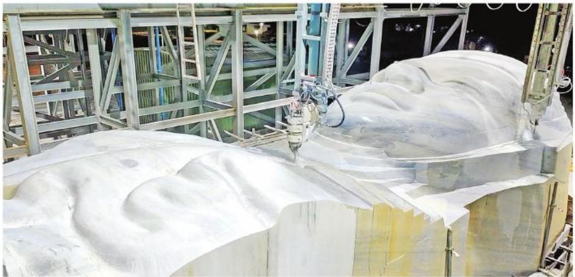
ဆင်းတုတော် အပိုင်း(၁)အား CNC စက်ဖြင့် စက်စားခြင်းအဆင့်ဆင့်ကို တွေ့ရစဉ်။

သောကြောင့် ယနေ့ထက်တိုင် ပြည်သူများ ကိုးကွယ်နိုင်သည့်ကုသိုလ်ထူးကိုရရှိနေကြသည်။ ဘာသာသာသနာကိုစောင့်ရှောက်ကြည့်ရှုမင်းများပေါ်ထွက်လာသည့်အခါတိုင်း သာသနာတော်ထွန်းကားပြန့်ပွားရေးအတွက် စေတီ၊ ပုထိုး၊ ကျောင်း၊ ဇရပ်၊ ဗုဒ္ဓရုပ်ပွားတော်များနှင့်သာသနိကအဆောက်အအုံများဆောက်လုပ်တည်ထားကိုးကွယ်ခဲ့သည့်အတွက် မြန်မာနိုင်ငံတစ်ဝန်းလုံးတွင် ရွှေရောင်တဖိတ်ဖိတ် တောက်ပလျက်ရှိသည်။ ထို့ကြောင့် မြန်မာနိုင်ငံကို ရွှေနိုင်ငံ (Golden Land) ဟု ကမ္ဘာက အသိအမှတ်ပြုလက်ခံလျက်ရှိပါသည်။ ဘုရားရှင်ကိုယ်ပွားရုပ်ပွားတော်မြတ်များကိုဖူးမြော်ရသည်မှာ စိတ်အေးချမ်းသာ