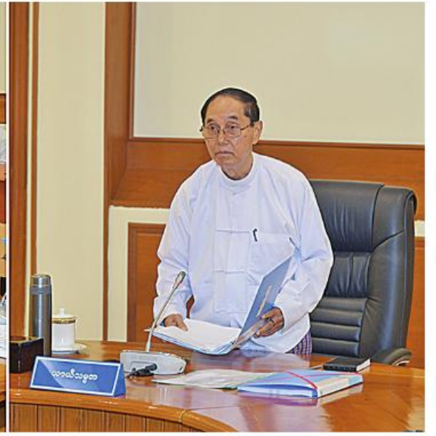
ယာယီသမ္မတ ဦးမြင့်ဆွေ ပြည်ထောင်စုသမ္မတမြန်မာနိုင်ငံတော် အမျိုးသားကာကွယ်ရေးနှင့် လုံခြုံရေးကောင်စီအစည်းအဝေး(၂/၂၀၂၃)တွင် ဆွေးနွေးပြောကြားစဉ်။