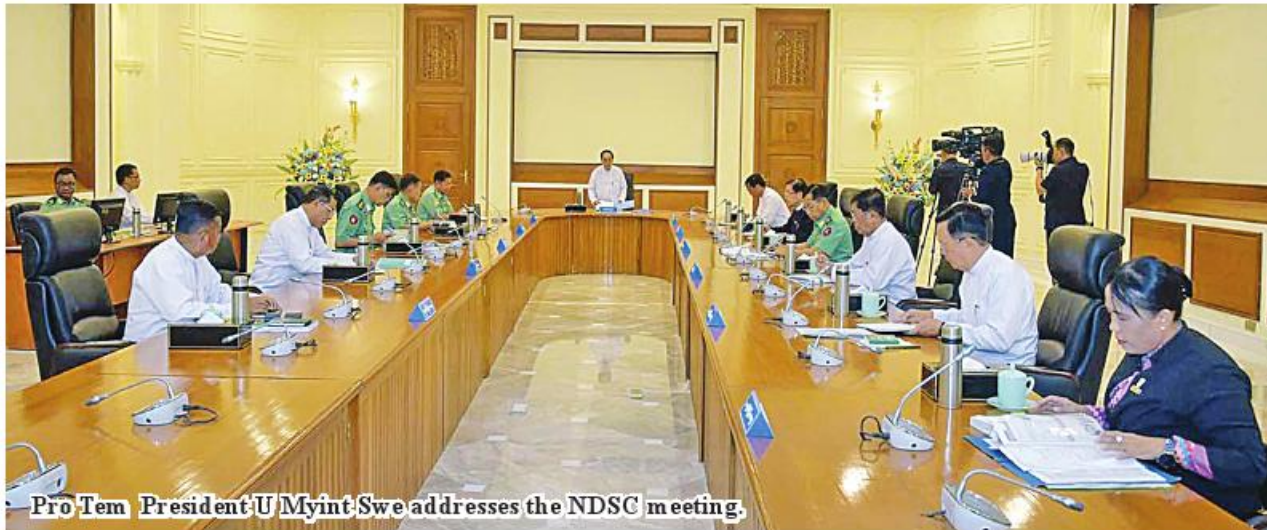
Pro Tem President U Myint Swe addresses the NDSC meeting.