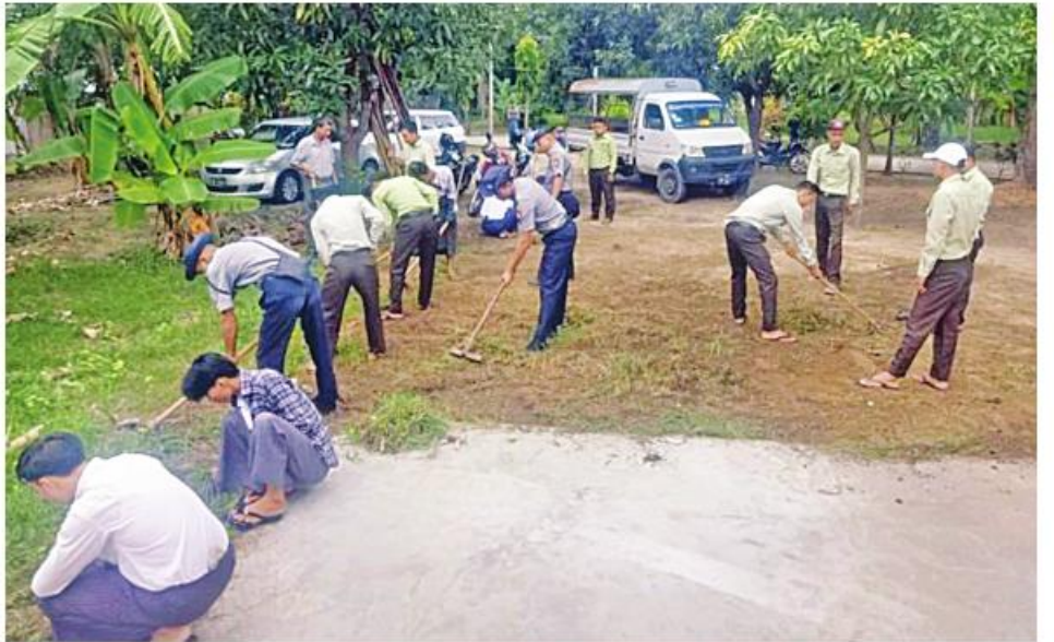
နေပြည်တော်ကောင်စီနယ်မြေ ဓမ္မသီရိမြို့နယ်အတွင်းရှိ စခန်းသာဘုန်းတော်ကြီးကျောင်းတွင် စုပေါင်း သန့်ရှင်းရေး ဆောင်ရွက်ကြစဉ်။

နေပြည်တော် ဇူလိုင် ၃၁ တိုင်းဒေသကြီးနှင့် ပြည်နယ်များ အတွင်းရှိ မြို့နယ်များမှ ဘုရား၊ စေတီပုထိုးများ၊ ဘုန်းတော်ကြီးကျောင်းများ၌ ဘုရားဖူးလာရဟန်းရှင်လူပြည်သူများ၊ ဥပုသ်သီတင်းဆောက်တည်ကြသူများ၊ စိတ်အေးချမ်းသာစွာ ဘုရားဖူးမြော်နိုင်ရေး၊ တရားဘာဝနာများအားထုတ်နိုင်ရေးနှင့် မြို့ရွာများ သန့်ရှင်းသာယာလှပရေးတို့အတွက် တိုင်းစစ်ဌာနချုပ်အသီးသီးမှ နယ်မြေခံ