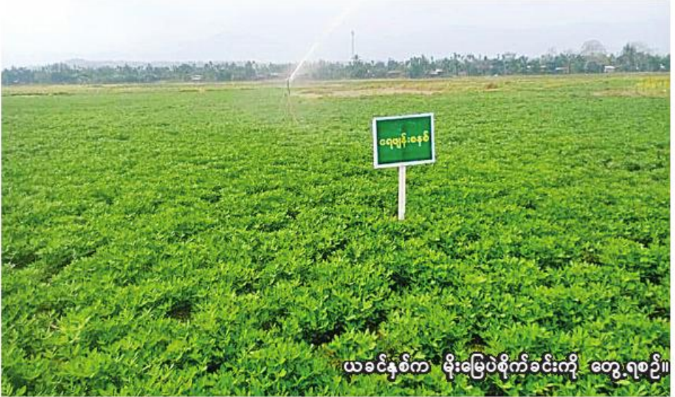
ယခင်နှစ်က မိုးမြေပဲစိုက်ခင်းကို တွေ့ရစဉ်။

ဟုမ္မလင်းမြို့နယ်တွင် ယခုနှစ် မိုးသီးနှံစိုက်ပျိုးမည့်တောင်သူများကို မြို့နယ်စိုက်ပျိုးရေးဦးစီးဌာနက သင်တန်းပေးခြင်း၊ ကွင်းသရုပ်ပြပွဲများဆောင်ရွက်ပေးခြင်း၊ ဆွေးနွေးပွဲများ ဆောင်ရွက်ပေးခြင်း၊ စိုက်ပျိုးရေးနည်းစနစ်များ လက်တွေ့ပြသဆောင်ရွက်ပေးခြင်း၊ သဘာဝမြေဩဇာပြုလုပ်သုံးစွဲခြင်း၊ မိုးရွာရောဂါမကျရောက်အောင် ကာကွယ်နည်းများကို ကွင်းဆင်းဆောင်ရွက်ပေးလျက်ရှိကြောင်း သိရသည်။ (၂၀၆)