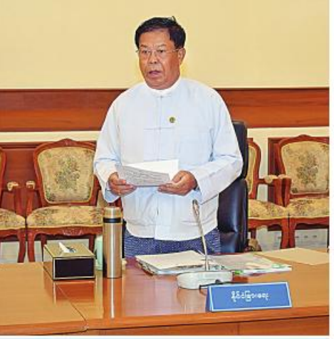
နိုင်ငံခြားရေးဝန်ကြီးဌာန ပြည်ထောင်စုဝန်ကြီး ဦးသန်းဆွေ ဆွေးနွေးတင်ပြစဉ်။