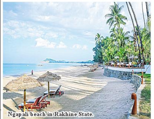
Ngapali beach in Rakhine State.