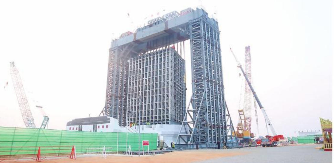
ဆင်းတုတော်အပိုင်းများအား သံမဏိမျှော်စင်ဝန်ချိစက်ဖြင့် ရတနာပလ္လင်တော်ထက်သို့ ပင့်ဆောင်နေရာချထားပြီးစီးမှုကို တွေ့ရစဉ်။

ကြည်နူးမှုဖြစ်သလို မကောင်းမှုကိုမပြုလိုသည့်စိတ်ကောင်းများကို မွေးမြူကြသည်။ နိုင်ငံတော်စီမံအုပ်ချုပ်ရေးကောင်စီဥက္ကဋ္ဌ နိုင်ငံတော်ဝန်ကြီးချုပ် ဇိုလ်ချုပ်မျိုးကြီးမင်းအောင်လှိုင်က ဦးဆောင်ဘုရားဒါယကာအဖြစ် ပြည်ထောင်စုနယ်မြေနေပြည်တော်၌ “မာရဝိဇယ”ဗုဒ္ဓရုပ်ပွားတော်မြတ်ကြီးကို တည်ထားလျက်ရှိသည်။ မာရဝိဇယဗုဒ္ဓရုပ်ပွားတော်မြတ်ကြီးသည် ကမ္ဘာပေါ်ရှိ ထိုင်တော်မူကျောက်ဆင်းတုတော်များအနက် ဉာဏ်တော်အမြင့်ဆုံးဖြစ်သည်။ မာရဝိဇယဟူသောဘွဲ့တော်အမည်မှာ “မာရ်နတ်မင်း၏အနှောင့်အယှက်ရန်စွယ်အန္တရာယ်အပေါင်းကို အထူးအောင်မြင်တော်မူသောမြတ်စွာဘုရား” ဟူ၍ အဓိပ္ပာယ်ရသည်။ မြတ်စွာဘုရားရှင်သည် အတွင်းရန်၊ အပြင်ရန်အပေါင်းကိုအောင်မြင်တော်မူခဲ့သည်။ ထိုအထဲတွင် မာရ်နတ်မင်း၏နှောင့်ယှက်မှုကိုလည်း အောင်မြင်တော်မူကာ တစ်လောကလုံး၏ကိုးကွယ်ဆည်းကပ်ပူဇော်ခြင်းကိုခံယူတော်မူခဲ့သည်။