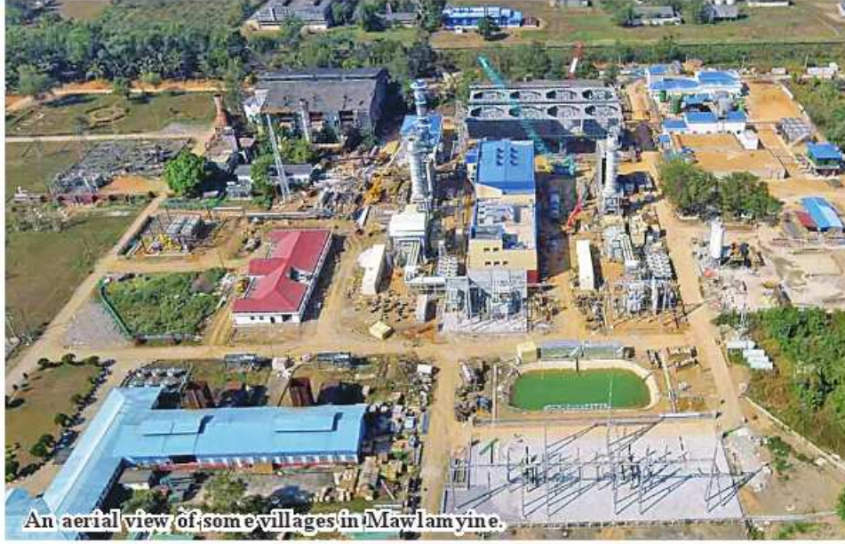
An aerial view of some villages in Mawlamyine.

Mawlamyine July 21 If the national electrification plan has completed in 2023-24 financial year, more than 920 villages in Mawlamyine and Thaton districts of Mon State will have to consume electricity, according to the Ministry of Electric Power.