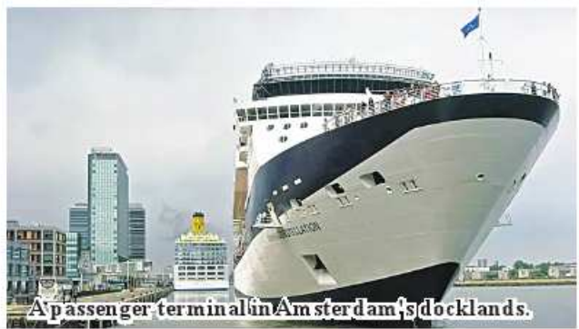
A passenger terminal in Amsterdam's docklands.