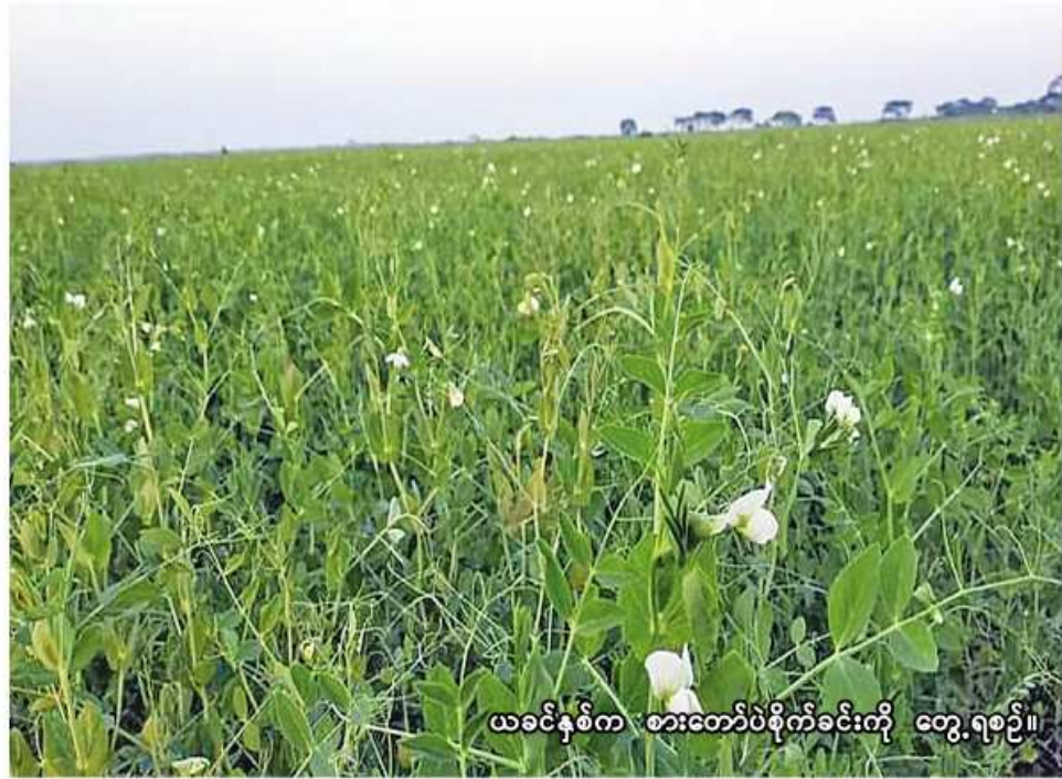
ယခင်နှစ်က စားတော်ပဲစိုက်ခင်းကို တွေ့ရစဉ်။