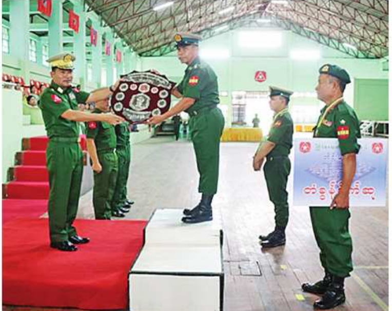
တြိဂံဒေသတိုင်းစစ်ဌာနချုပ် တိုင်းမှူး ဗိုလ်ချုပ်အောင်ခိုင်ဝင်း ခိုင်းဆုရရှိသော အသင်းကို ခိုင်းဆုပေးအပ်ချီးမြှင့်စဉ်။

ဦးစွာ တိုင်းမှူးနှင့် တာဝန်ရှိသူများက အသင်းလိုက်ဆုရရှိသူများနှင့် တစ်ဦးချင်း ဆုရရှိသူများကို ဆုတံဆိပ်များနှင့်ဂုဏ်ပြုဆု ငွေများအသီးသီးပေးအပ်ချီးမြှင့်ကြသည်။ အဆိုပါစစ်တုရင်ပြိုင်ပွဲကို တိုင်းစစ် ဌာနချုပ်ကွပ်ကဲမှုအောက် တပ်နယ် အသီးသီးမှ ပြိုင်ပွဲဝင်အသင်း ၁၄ သင်းဖြင့် ဇူလိုင် ၁၇ ရက်မှ ယနေ့ထိ ယှဉ်ပြိုင်ကစား ခဲ့ကြောင်း သတင်းရရှိသည်။