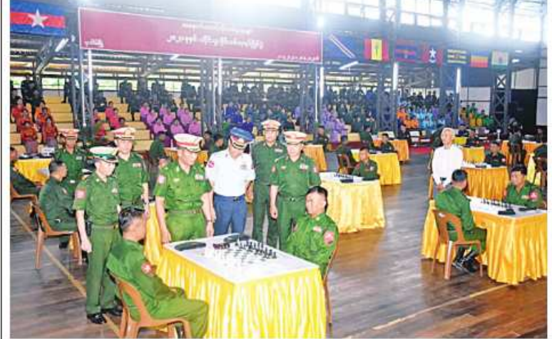
အနောက်တောင်တိုင်းစစ်ဌာနချုပ် တိုင်းမှူး ဝိုင်းလှည့်နှင့် ဦး ပြိုင်ပွဲဝင် အသင်းများ၏ ယှဉ်ပြိုင်ကစားနေမှုများကို ကြည့်ရှုအားပေးစဉ်။

နေပြည်တော် ၇လိုင် ၂၁ အနောက်တောင်တိုင်း စစ်ဌာနချုပ် ၂၀၂၃ ခုနှစ် တိုင်းမှူးဒိုင်း စစ်တုရင်ပြိုင်ပွဲ ဖွင့်ပွဲကို ယနေ့နံနက်ပိုင်းတွင် တိုင်းစစ် ဌာနချုပ် တပ်နယ်အားကစားရုံ၌ ပြုလုပ်ရာ တိုင်းမှူး ဝိုင်းလှည့်နှင့် ဦး နှင့် တာဝန်ရှိသူများ၊ အရာရှိ၊ စစ်သည်၊ မိသားစုဝင်များ၊ ပြိုင်ပွဲဝင် အားကစား သမားများနှင့် ခိုင်အဖွဲ့ဝင်များ တက်ရောက် ကြသည်။ ဦးစွာ တိုင်းမှူးက အဖွင့်အမှာစကား ပြောကြားပြီး ပြိုင်ပွဲကိုဖွင့်လှစ်ပေးကာ တက်ရောက်လာကြသူများနှင့်အတူ ပြိုင်ပွဲ ဝင်အသင်းများ၏ ယှဉ်ပြိုင်ကစားနေမှုများ ကို ကြည့်ရှုအားပေးကြသည်။ အဆိုပါ စစ်တုရင်ပြိုင်ပွဲကို တိုင်းစစ် ဌာနချုပ်ကွပ်ကဲမှုအောက် တပ်ရင်း၊ တပ်ဖွဲ့ များမှ ပြိုင်ပွဲဝင်အသင်း ၁၀ သင်းဖြင့် ၇လိုင် ၂၀ ရက်ထိ ယှဉ်ပြိုင်ကစားသွားမည် ဖြစ်ကြောင်း သတင်းရရှိသည်။