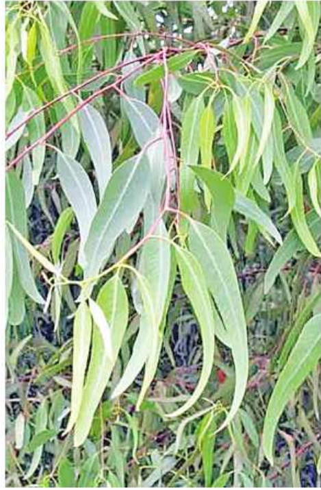
ယူကလစ် (ယူကလစ်တပ်ပင်) အင်္ဂလိပ်အမည် - Australian Fever Tree. မျိုးရင်း - Myrtaceae (မာလာကာမျိုးရင်း) ရုက္ခဗေဒအမည် - Eucalyptus globulus Labill.

အဓိကဆေးဖက်ဝင်ပုံ အနာပေါက်၊ ပြည်တည်နာ၊ ရောင်ရမ်းနာ၊ ပန်းနာ၊ ရင်ကျပ်၊ ခွဲသလိပ်ရောဂါ၊ အဆိပ်သင့်၍ ဖျားခြင်း၊ ကြက်ညှာချောင်းဆိုးနှင့် ခွဲစိတ်ထားသောဒဏ်ရာများ အတွက် အသုံးပြုသည်။ အဆစ်အဖျက်ကိုကဲခဲခြင်းနှင့် ရောင်ရမ်းခြင်းများအတွက် လိမ်းဆေးအဖြစ်လည်း အသုံးပြုသည်။ ပေါက်ရောက်သည့်ဒေသ မြန်မာနိုင်ငံအနှံ့အပြားတွင် စိုက်ပျိုးဖြစ်ထွန်းသည်။ အအေးပိုင်းနှင့် သမပိုင်းဒေသတွင် ပို၍ ပေါက်ရောက် ဖြစ်ထွန်းသည်။