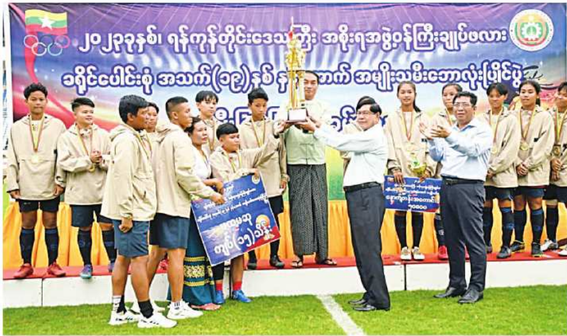
ရန်ကုန်တိုင်းဒေသကြီးဝန်ကြီးချုပ် ဦးစိုးသိန်း အင်းစိန်ခရိုင်အသင်းကို တံခွန်စိုက်ဆုဖလား ပေးအပ်ချီးမြှင့်စဉ်။

နေပြည်တော် ၇လိုင် ၂၁ ၂၀၂၃ ခုနှစ် ရန်ကုန်တိုင်းဒေသကြီး ဝန်ကြီးချုပ်ဖလား ခရိုင်ပေါင်းစုံ အသက် ၁၉ နှစ်နှင့်အောက် အမျိုးသမီး ဘောလုံး ပြိုင်ပွဲ ဝိုင်းလှည့်နှင့် ဆုချီးမြှင့်ပွဲကို ၇လိုင် ၂၀ ရက် ညနေပိုင်းတွင် သယ်န်းကျွန်းမြို့နယ် သုဝဏ္ဏ (Y.T.C)ဘောလုံးကွင်း၌ပြုလုပ်ရာ တိုင်းဒေသကြီးဝန်ကြီးချုပ် ဦးစိုးသိန်း၊ ရန်ကုန်တိုင်းစစ်ဌာနချုပ် တိုင်းမှူး ဝိုင်းလှည့် လော်ဟိန်းနှင့် တိုင်းဒေသကြီးဝန်ကြီးများ၊ ခိုင်အဖွဲ့ဝင်များ၊ ပြိုင်ပွဲဝင် အားကစား သမားများနှင့် ဖိတ်ကြားထားသူများ တက်ရောက်ကြသည်။ ဦးစွာ တက်ရောက်လာကြသူများက အင်းစိန်ခရိုင်အသင်းနှင့် တွဲတေးခရိုင် အသင်းတို့၏ ဝိုင်းလှည့်ပွဲ ယှဉ်ပြိုင်နေမှု များကို ကြည့်ရှုအားပေးကြသည်။ ထို့နောက် ဆုချီးမြှင့်ပွဲကို ဆက်လက်ပြုလုပ် ရာ တစ်ဦးချင်း အကောင်းဆုံးဆုရရှိသူများ၊ အသင်းလိုက်ဆုများ၊ တံခွန်စိုက်ဆုဖလား ဆုရရှိခဲ့သည် အင်းစိန်ခရိုင်အသင်းတို့ကို တိုင်းဒေသကြီးဝန်ကြီးချုပ်၊ တိုင်းမှူးနှင့် တာဝန်ရှိသူများက ဖလားဆု၊ ဆုတံဆိပ် များနှင့် ငွေသားဆုများကို အသီးသီး ချီးမြှင့် ပေးအပ်ကြပြီး စုပေါင်းဓာတ်ပုံရိုက်ကြကာ အားကစားသမားများကို ရင်းရင်းနှီးနှီး နှုတ်ဆက်ခဲ့ကြကြောင်း သတင်းရရှိသည်။