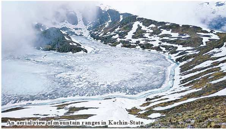
An aerial view of mountain ranges in Kachin State.

2021, K3,249.1 million and US$47,535 in 2022 and K1,333 million and US$10,755 from January to July 2023."