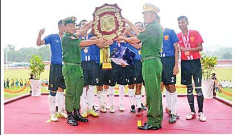
အရှေ့မြောက်တိုင်းစစ်ဌာနချုပ် တိုင်းမှူး ဝိုင်းလှည့်နှင့် ဦး လားရှိုးတပ်နယ် အသင်းကို ခိုင်းဆုပေးအပ်ချီးမြှင့်စဉ်။

နေပြည်တော် ၇လိုင် ၂၁ အရှေ့မြောက်တိုင်း စစ်ဌာနချုပ် ၂၀၂၃ ခုနှစ် တိုင်းမှူးဒိုင်း ဘောလုံးပြိုင်ပွဲ ဝိုင်းလှည့်နှင့် ဆုပေးပွဲကို ယနေ့ညနေပိုင်း တွင် တိုင်းစစ်ဌာနချုပ် ဝေယျသိဒ္ဓိအားကစား ကွင်း၌ပြုလုပ်ရာ တိုင်းမှူး ဝိုင်းလှည့်နှင့် ဦး နှင့် တာဝန်ရှိသူများ၊ အရာရှိ၊ စစ်သည်၊ မိသားစုဝင်များ၊ ခိုင်အဖွဲ့ဝင်များ၊ ပြိုင်ပွဲဝင် အားကစားသမားများနှင့် အားကစား ဝါသနာရှင်များ တက်ရောက်ကြသည်။ ဦးစွာ တိုင်းမှူးနှင့် တက်ရောက်လာကြ သူများက ဝိုင်းလှည့် ပွဲစဉ်ဖြစ်သည့် တိုင်းစစ်ဌာနချုပ်(စခန်းရုံး) အသင်းနှင့် လားရှိုးတပ်နယ်အသင်းတို့၏ ယှဉ်ပြိုင် တစားမူများကို ကြည့်ရှုအားပေးကြသည်။ ထို့နောက် ဆုပေးပွဲကို ဆက်လက်ပြုလုပ်ရာ အသင်းလိုက်ဆုရရှိသူများ၊ တစ်ဦးချင်း ဆုရရှိသူများ၊ ခိုင်အဖွဲ့ဝင်များနှင့် ခိုင်းဆု ရရှိသော လားရှိုးတပ်နယ်အသင်းတို့ကို တိုင်းမှူးနှင့် တာဝန်ရှိသူများက ခိုင်းဆုနှင့် ဂုဏ်ပြုဆုငွေများ အသီးသီး ပေးအပ်ချီးမြှင့် ကြသည်။ အဆိုပါ ဘောလုံးပြိုင်ပွဲကို တိုင်းစစ် ဌာနချုပ်ကွပ်ကဲမှုအောက် တပ်ရင်း၊ တပ်ဖွဲ့ များမှ ပြိုင်ပွဲဝင်အသင်း ရှစ်သင်းဖြင့် အုပ်စု နှစ်စုခွဲကာ ၇လိုင် ၁၂ ရက်မှ ယနေ့ ထိ ယှဉ်ပြိုင်ကစားခဲ့ခြင်းဖြစ်ကြောင်း သတင်းရရှိသည်။