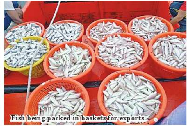
Fish being packed in baskets for exports.

export of fishes, crabs, lobsters, snails, and others to Thailand. 336