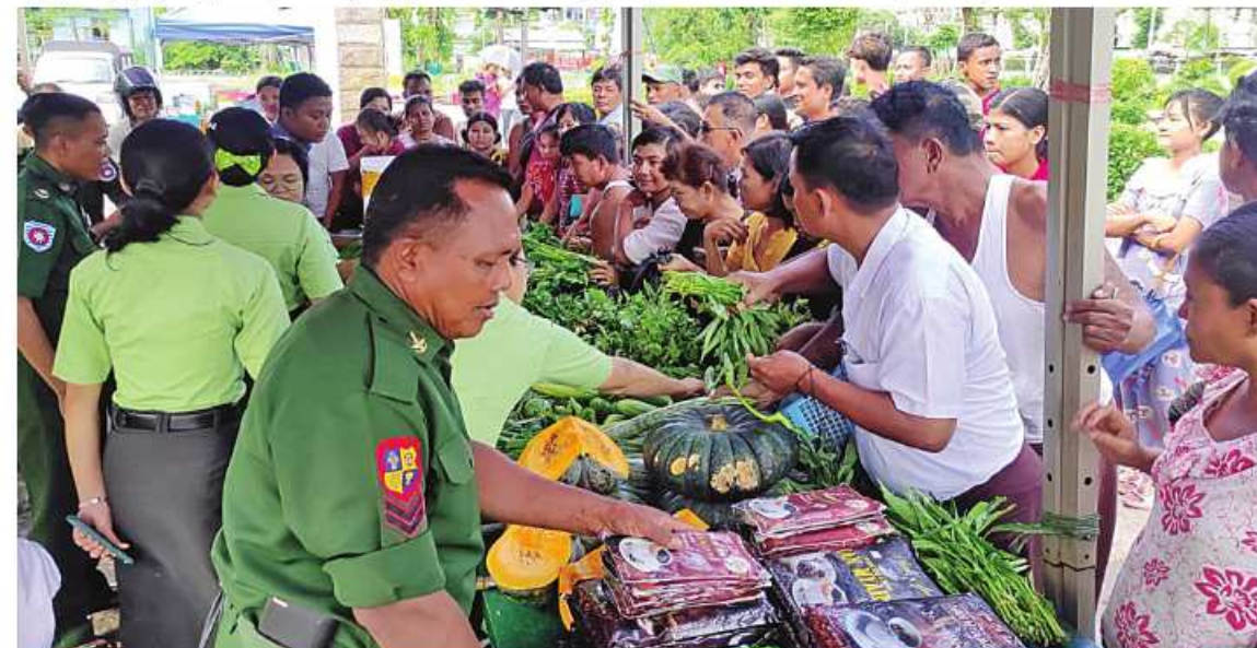
နယ်မြေခံတပ်မတော်သားများနှင့် တာဝန်ရှိသူများက မုန်တိုင်းဒဏ်သင့်ပြည်သူများကို ဆန်၊ ဆီ၊ ဆား၊ ကြက်ဥ၊ ဟင်းသီးဟင်းရွက်များ၊ စားသောက်ကုန်ပစ္စည်းများနှင့် လူသုံးကုန်ပစ္စည်းများကို ဈေးနှုန်းသက်သာစွာဖြင့် ရောင်းချပေးစဉ်။

များဖြစ်သည့် အမဲသားဘူး၊ မျှစ်စားတော်ပဲဘူး၊ ကြက်သားအာလူးဘူး၊ ငါးတန်အချိုပေါင်းဘူး၊ ငါးသလောက်ဘူး၊ ငါးပိကြော်ဘူး၊ ပဲထောပတ်ဘူး၊ ပဲခရမ်းဘူး၊ သရက်သီးသနပ်ဘူး စသည့် စားသောက်ကုန်များ၊ မြန်မာစီးပွားရေးဦးပိုင်အများနှင့်သက်ဆိုင်သော ကုမ္ပဏီလီမိတက် အရောင်းဆိုင်များ၏ စားကုန်ပစ္စည်းများ၊ လျှပ်စစ်ပစ္စည်းများနှင့် အိမ်ဆောက်ပစ္စည်းများကို ပြင်ပပေါက်ဈေးထက် သက်သာသောဈေးနှုန်းများဖြင့် ဆက်လက်ရောင်းချပေးလျက်ရှိသည်။ ထိုသို့ရောင်းချပေးလျက်ရှိရာ ဒေသပြည်သူများနှင့် ဌာနဆိုင်ရာဝန်ထမ်းမိသားစုများက တစ်ခဲနက်ဝယ်ယူအားပေးကြကြောင်းနှင့် ယခုကဲ့သို့ စားရေးအခက်အခဲဖြစ်ပေါ်နေချိန်တွင် သက်သာသောဈေးနှုန်းများဖြင့် ရောင်းချပေးမှုအပေါ် တာဝန်ရှိသူများကို အထူးပင်ကျေးဇူးတင်ရှိကြောင်း သတင်းရရှိသည်။