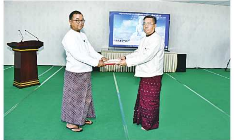
နိုင်ငံတော်စီမံအုပ်ချုပ်ရေးကောင်စီ သတင်းထုတ်ပြန်ရေးအဖွဲ့ခေါင်းဆောင် ဗိုလ်ချုပ်စောမင်းထွန်းထံ သတင်းမီဒီယာများက အလှူငွေများ ပေးအပ်လှူဒါန်းစဉ်