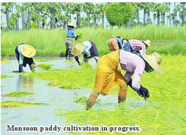
Monsoon paddy cultivation in progress.