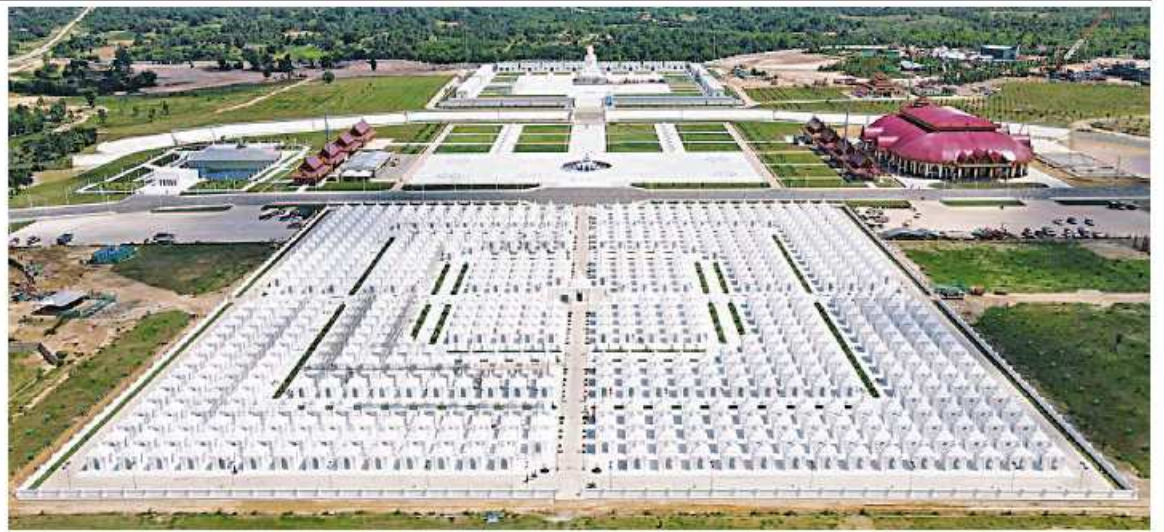
မာရဝိဇယဗုဒ္ဓရုပ်ပွားတော်မြတ်ကြီးနှင့် ဗုဒ္ဓဥယျာဉ်တော်ကို တွေ့ရစဉ်