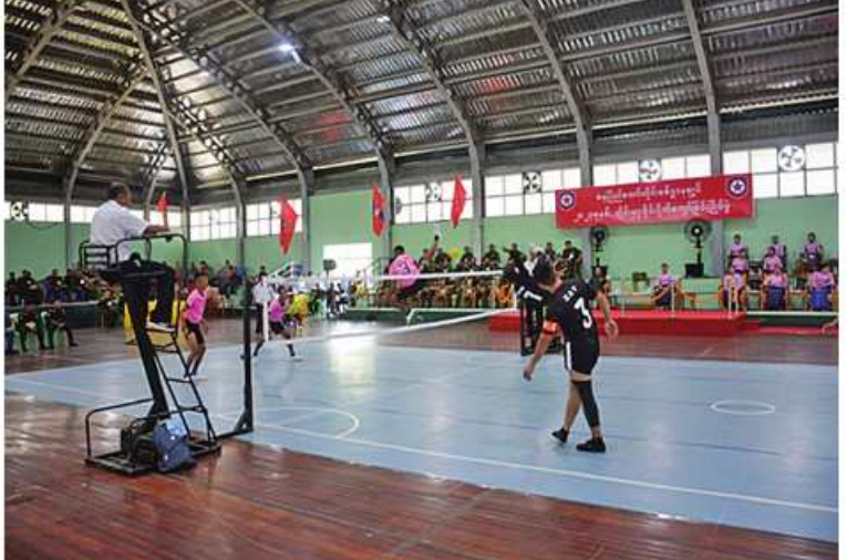
နေပြည်တော်တိုင်းစစ်ဌာနချုပ် တိုင်းမှူးဒိုင်း ပိုက်ကျော်ခြင်းပြိုင်ပွဲ အဖွင့်ပွဲစဉ် ယှဉ်ပြိုင်ကစားနေမှုကို တွေ့ရစဉ်။

ဦးစွာ တိုင်းမှူးများက အဖွင့်အမှာ စကားများ အသီးသီးပြောကြားကြသည်။ ထို့နောက် တိုင်းမှူးများနှင့် တက်ရောက် လာကြသူများက ပြိုင်ပွဲဝင်အသင်းများ၏ အဖွင့်ပွဲစဉ်ယှဉ်ပြိုင်နေမှုများကို ကြည့်ရှု အားပေးကြသည်။ အဆိုပါပိုက်ကျော်ခြင်းပြိုင်ပွဲကို တိုင်း စစ်ဌာနချုပ်ကွပ်ကဲမှုအောက်ရှိ တပ်နယ် အသီးသီးမှ ပြိုင်ပွဲဝင်အသင်းများဖြင့် ဇူလိုင် ၂၈ ရက်ထိ ယှဉ်ပြိုင်ကစားသွား မည်ဖြစ်ကြောင်း သတင်းရရှိသည်။