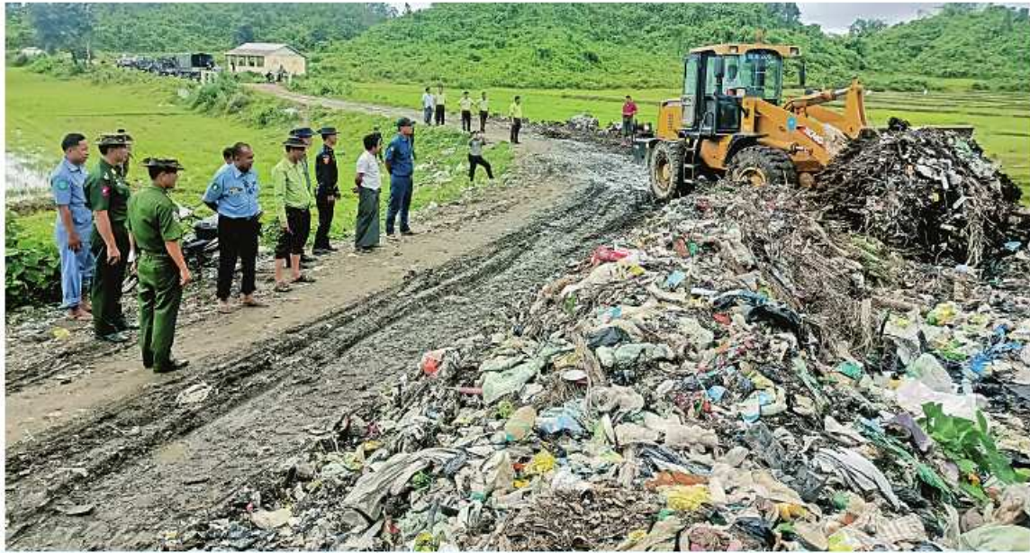
ကာကွယ်ရေးဦးစီးချုပ်ရုံး(ကြည်း)မှ ဒုတိယဗိုလ်ချုပ်ကြီးအေးဝင်း၊ ဘူးသီးတောင်-တောင်ဘဲလမ်းဘေး၌ ပိတ်ဆို့နေသော အမှိုက်များအား စက်ယန္တရားများဖြင့် ဖယ်ရှားရှင်းလင်းနေမှုများကို ကြည့်ရှုစစ်ဆေးစဉ်။

နေပြည်တော် ဇူလိုင် ၂၁ - ဆိုင်ကလုန်းမုန်တိုင်း(မိုခါ) တိုက်ခတ်မှုကြောင့် ထိခိုက်ပျက်စီးခဲ့သည့် ဒေသများတွင် ပြန်လည်ထူထောင်ရေးလုပ်ငန်းများ ဆောင်ရွက်နိုင်ရန် ဒေသအလိုက် တပ်မတော်အရာရှိကြီးများကို ခန့်အပ်