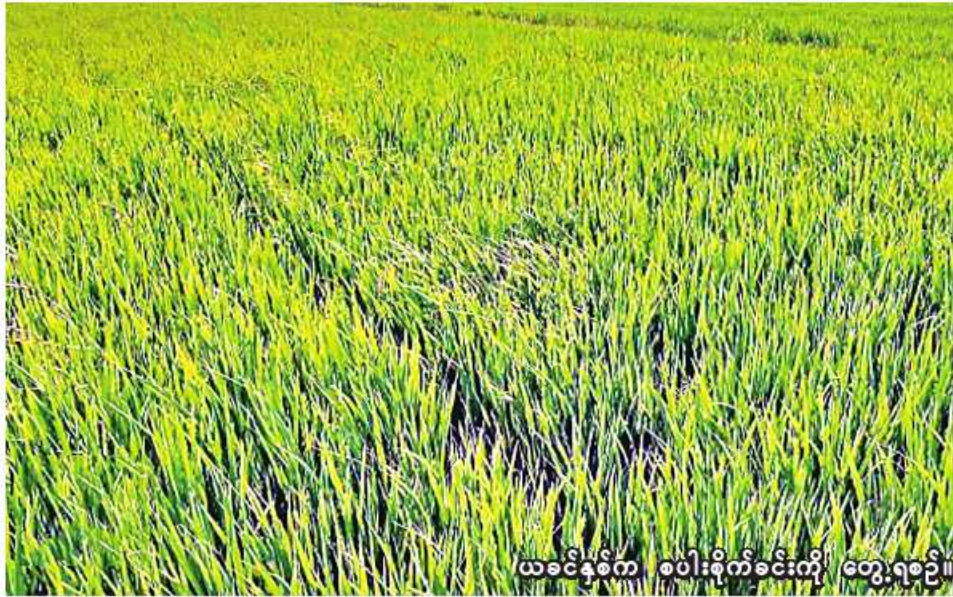
ယခင်နှစ်က စပါးစိုက်ခင်းကို တွေ့ရစဉ်။

ကျွန်းလှမြို့နယ်အတွင်းရှိ လယ်ယာမြေများသည် မိုးကောင်းသောကြောင့် ဖြစ်သော်လည်း မိုးစပါးအချိန်မီ စိုက်ပျိုးနိုင်ရန်အတွက် ချောင်းပိတ်၊ မြောင်းပိတ်နှင့် မြေအောက်ရေတင်ပြီး ပျိုးထောင်ခြင်း၊ မြေယာပြင်ခြင်းလုပ်ငန်းများ ဆောင်ရွက်လျက်ရှိကြောင်း သိရသည်။