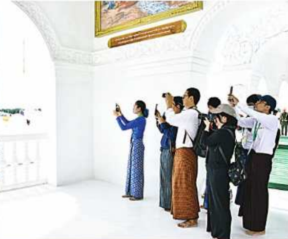
သတင်းစာရင်းလင်းပွဲသို့ တက်ရောက်လာကြသည့် သတင်းမီဒီယာများ မာရဝိဇယဗုဒ္ဓရုပ်ပွားတော်မြတ်ကြီးကို ဖူးမြော်ကြည့်ညိဉ်း