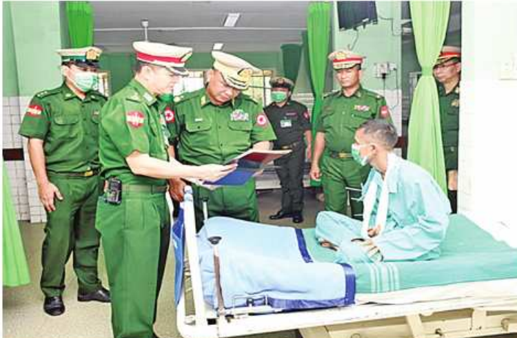
ရန်ကုန်တိုင်းစစ်ဌာနချုပ် တိုင်းမှူး ဗိုလ်ချုပ်စောဟိန်း ဆေးကုသမှုခံယူနေသူ တစ်ဦးကို ရင်းရင်းနှီးနှီးမေးမြန်းအားပေးစကားပြောကြားစဉ်။

နေပြည်တော် ဇူလိုင် ၂၁ တနင်္သာရီတိုင်းဒေသကြီး ကော့ သောင်းမြို့ရှိ တပ်မတော်ဆေးရုံ၊ ရန်ကုန် တိုင်းဒေသကြီး မင်္ဂလာဒုံမြို့နယ်ရှိ တပ်မတော်အရိုးရောဂါအထူးကုဆေးရုံကြီး (ခုတင်-၅၀၀)၊ တပ်မတော်ဆေးရုံကြီး (ခုတင်-၁၀၀၀)နှင့် တပ်မတော်သားဖွား မီးယပ်နှင့် ကလေးဆေးရုံ (ခုတင်-၃၀၀)၊ ရောဂါတိုင်းဒေသကြီး ပုသိမ်မြို့ရှိ နယ် မြေခံဆေးတပ်ရင်း၊ မန္တလေးတိုင်းဒေသကြီး ပြင်ဦးလွင်မြို့ရှိ တပ်မတော်ဆေးရုံနှင့် ပဲခူး တိုင်းဒေသကြီး တောင်ငူမြို့ရှိ တပ်မတော် ဆေးရုံတို့၌ တက်ရောက်ဆေးကုသမှုခံယူ နေသော အရာရှိ၊ စစ်သည်၊ မိသားစုများနှင့် ဒေသခံပြည်သူများကို ဇူလိုင် ၂၀ ရက်နှင့် ယနေ့တို့တွင် သက်ဆိုင်ရာတိုင်းစစ်ဌာန ချုပ်အသီးသီးမှ တိုင်းမှူးများနှင့် တာဝန်ရှိ သူများက သွားရောက်ကြည့်ရှု၍ တစ်ဦး ချင်း၏ ရောဂါဖြစ်ပွားမှု၊ ဆေးဝါးကုသပေး ထားမှု၊ ကုန်းမာရေးတိုးတက်ကောင်းမွန်မှု အခြေအနေများကို ရင်းရင်းနှီးနှီးလိုက်လံ မေးမြန်းအားပေးစကား ပြောကြားပြီး အာဟာရဖြည့်စားသောက်ဖွယ်ရာများနှင့် ထောက်ပံ့ငွေများပေးအပ်သည်။ ထို့နောက် တိုင်းမှူးများနှင့် တာဝန်ရှိ သူများက ဆေးရုံများအတွင်း လှည့်လည် ကြည့်ရှု၍ လိုအပ်သည်များ ပေါင်းစပ် ညှိနှိုင်းဆောင်ရွက်ပေးခဲ့ကြကြောင်း သတင်း ရရှိသည်။