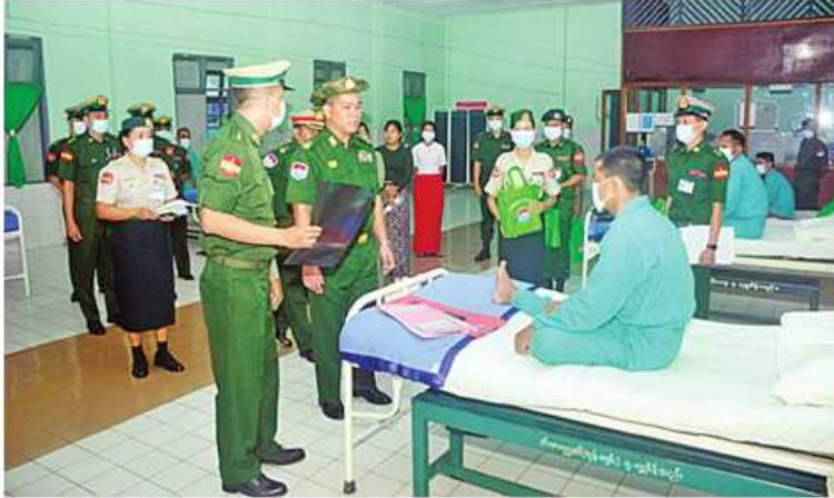
ကမ်းရိုးတန်းဒေသတိုင်းစစ်ဌာနချုပ် တိုင်းမှူး ဗိုလ်ချုပ်စောသန်းလှိုင် ဆေးကုသမှု ခံယူနေသူတစ်ဦးကို ရင်းရင်းနှီးနှီးမေးမြန်းအားပေးစကားပြောကြားစဉ်။