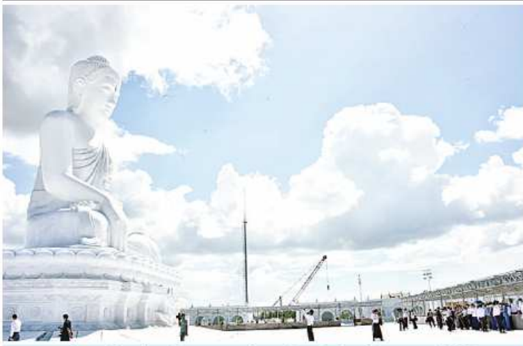
သတင်းစာရင်းလင်းပွဲသို့ တက်ရောက်လာကြသည့် သတင်းမီဒီယာများ မာရဝိဇယဗုဒ္ဓရုပ်ပွားတော်မြတ်ကြီးကို ဖူးမြော်ကြည့်ညိဉ်း