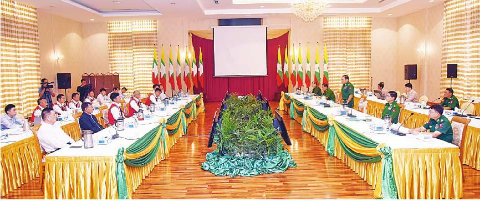
နိုင်ငံတော်၏ ငြိမ်းချမ်းရေးဆွေးနွေးရေးအဖွဲ့နှင့် “ဝ”ပြည်သွေးစည်းညီညွတ်ရေးပါတီ(UWSP)၊ အမျိုးသားဒီမိုကရက်တစ်မဟာမိတ်အဖွဲ့(NDAA)၊ ရှမ်းပြည်တိုးတက်ရေးပါတီ(SSPP) ကိုယ်စားလှယ်အဖွဲ့တို့ ဒုတိယနေ့ ငြိမ်းချမ်းရေးတွေ့ဆုံဆွေးနွေးစဉ်။

နေပြည်တော် ဇူလိုင် ၂၁ ။ ငြိမ်းချမ်းရေး တွေ့ဆုံဆွေးနွေးပွဲကို နိုင်ငံတော်၏ ငြိမ်းချမ်းရေးဆွေးနွေးရေးအဖွဲ့နှင့် “ဝ” ပြည်သွေးစည်းညီညွတ်ရေးပါတီ(UWSP)၊ အမျိုးသားဒီမိုကရက်တစ်မဟာမိတ်အဖွဲ့ (NDAA)၊ ရှမ်းပြည်တိုးတက်ရေးပါတီ (SSPP) ကိုယ်စားလှယ်အဖွဲ့တို့ ဒုတိယနေ့ ငြိမ်းချမ်းရေးတွေ့ဆုံဆွေးနွေးပွဲကို ယနေ့နံနက်ပိုင်းတွင် နေပြည်တော်ရှိ Horizon Lake View ဟိုတယ်၌ ကျင်းပပြုလုပ်သည်။ တွေ့ဆုံဆွေးနွေးပွဲသို့ နိုင်ငံတော် စီမံအုပ်ချုပ်ရေးကောင်စီ အဖွဲ့ဝင် ဖော်ဆောင်မှု ညှိနှိုင်းရေးကော်မတီ ညှိနှိုင်းရေးကော်မတီ အတွင်းရေးမှူး ဒုတိယဗိုလ်ချုပ်ကြီး ဝင်းဗိုလ်ရှိန်နှင့် ညှိနှိုင်းရေးကော်မတီ အဖွဲ့ဝင်များ၊ “ဝ”ပြည်သွေးစည်းညီညွတ်ရေးပါတီ(UWSP)မှ ဒုတိယဥက္ကဋ္ဌ ဦးလော့ယာကျ၊ အမျိုးသားဒီမိုကရက်တစ်မဟာမိတ်အဖွဲ့(NDAA)မှ ဒုတိယဥက္ကဋ္ဌ ဦးစန်ပေ၊ စာမျက်နှာ ၁၇ ကော်လံ ၅-၉