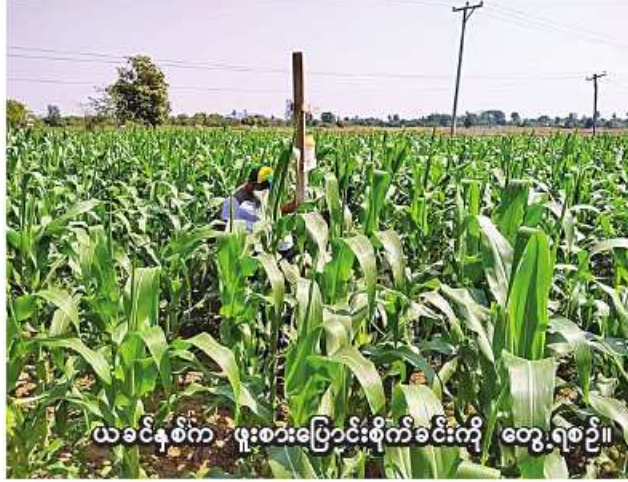
ယခင်နှစ်က ဖူးစားပြောင်းစိုက်ခင်းကို တွေ့ရစဉ်။