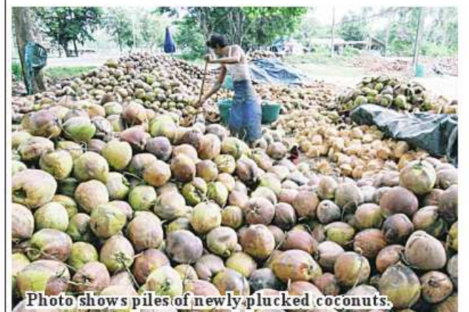
Photo shows piles of newly plucked coconuts.