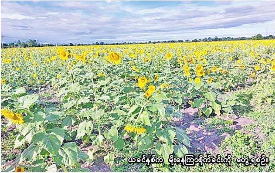
ယခင်နှစ်က မိုးနေကြာခရိုင်ခရိုင်ကို တွေ့ရဝင်ပြီ။

မြို့နယ်တွင် ၃၉၂ ကေ၊ မြောင်မြို့နယ်တွင် ၂၀၅ ကေ စုစုပေါင်း ၆၇၄ ကေဖြစ်ကြောင်း၊ လျာထားမှုအနေဖြင့် စစ်ကိုင်းမြို့နယ်တွင် ၁၂၂၁ ကေ၊ မြင်းမူမြို့နယ်တွင် ၂၀၁၅ ကေ၊ မြောင်မြို့နယ်တွင် ၅၂၉ ကေ စုစုပေါင်း ၁၄၇၆၅ ကေ ဖြစ်ကြောင်း သိရသည်။ ယခုနှစ်တွင် စစ်ကိုင်းခရိုင်အတွင်း နေကြာတိုးချဲ့စိုက်ပျိုးနိုင်ရေးအတွက် သက်ဆိုင်ရာမြို့နယ်စိုက်ပျိုးရေးဦးစီးဌာနက ဝန်ထမ်းများနှင့်တောင်သူများ စွမ်းဆောင်ရည်မြှင့်တင်ရေးအတွက် အသိပညာပေးသင်တန်းများကို အချိန်နှင့်ဆောင်ရွက်ပေးလျက်ရှိကြောင်း သိရသည်။ ထို့ပြင် ယခုနှစ် ဆောင်းသီးနှံစိုက်ပျိုးရာသီ၌ စစ်ကိုင်းခရိုင်တွင် ဆောင်းနေကြာ စိုက်ပျိုးရန်အတွက် မြို့နယ်အလိုက် လျာထားမှုအနေဖြင့် စစ်ကိုင်းမြို့နယ်တွင် ၃၁၂၄၂ ကေ၊ မြင်းမူမြို့နယ်တွင် ၁၇၁၇၀၊ မြောင်မြို့နယ်တွင် ၁၂၉၈၇ ကေ စုစုပေါင်း ၆၁၃၉၉ ကေဖြစ်ကြောင်း သိရသည်။ (၂၀၆)