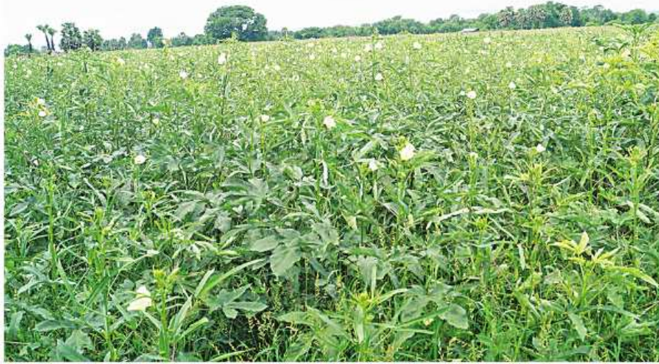
ပဲခူး ရုလိုင် ၁၅

ပဲခူးတိုင်းဒေသကြီး တောင်ငူမြို့နယ် ခပေါင်းတိန်ကျေးရွာတွင် ဂျပန်နိုင်ငံသို့ ရုံးပတီသီးများတင်ပို့ရောင်းချရန်အတွက် ရုံးပတီပင်စိုက်ပျိုးရေးလုပ်ငန်းများ လုပ်ကိုင်ဆောင်ရွက်နေကြောင်း ပဲခူးတိုင်းဒေသကြီး စားသုံးသူရေးရာဦးစီးဌာန၏ ရုလိုင် ၁၄ ရက် သတင်းများအရ သိရသည်။