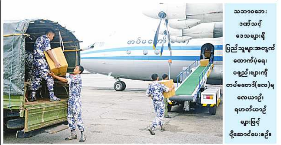
သဘာဝဘေးဒဏ်သင့်ဒေသများရှိ ပြည်သူများအတွက် ထောက်ပံ့ရေးပစ္စည်းများကို တပ်မတော်(လေ)မှ လေယာဉ်၊ ရဟတ်ယာဉ်များဖြင့် ပို့ဆောင်ပေးစဉ်။