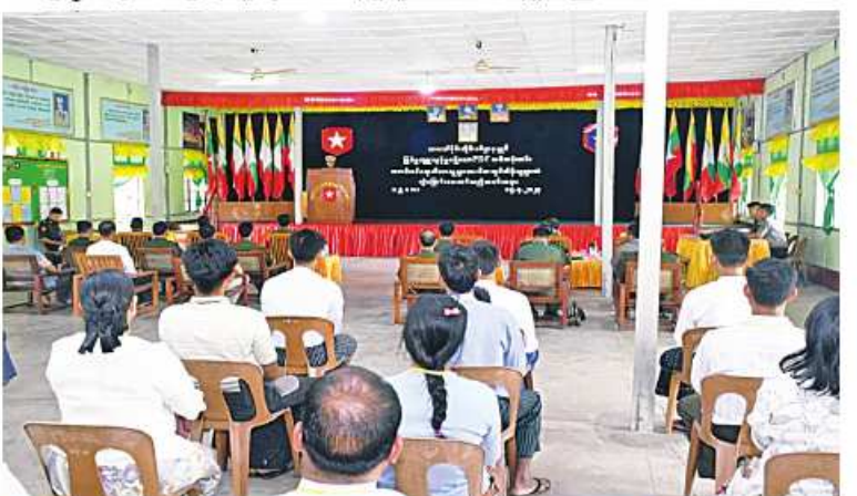
ဥပဒေအတွင်း ဝင်ရောက်လာသည့် PDF အဖွဲ့ဝင်များကို ၎င်းတို့၏ မိဘအုပ်ထိန်းသူများထံသို့ လွှဲပြောင်းပေးအပ်ပွဲကျင်းပစဉ်

ဒေသကြီး မင်္ဂလာဒုံမြို့နယ်ရှိ တပ်မတော် ဆေးတက္ကသိုလ် အားကစားခန်းမ၌ ပြုလုပ်ရာ တိုင်းမှူး ခိုင်းစစ်တုရင် ဝင်ရောက်ကြည့်ရှုခဲ့ပြီး တာဝန်ရှိသူများ၊ အရာရှိ၊ စစ်သည်၊ မိသားစုဝင်များ၊ ခိုင်အဖွဲ့ဝင်များနှင့်ပြိုင်ပွဲ ဝင် အသင်းများ တက်ရောက်ကြသည်။ ယင်းနောက် တိုင်းမှူးနှင့် တာဝန်ရှိသူများက ခိုင်အဖွဲ့ဝင်များ၊ အသင်းလိုက်နှင့် တစ်ဦးချင်း ဆုရရှိကြသူများ၊ ခိုင်းဆုရရှိသော အသင်းတို့ကို တံခွန်စိုက် ခိုင်းဆုနှင့် ဂုဏ်ပြုဆုငွေများ အသီးသီးပေးအပ်ချီးမြှင့်ကြသည်။ အဆိုပါ စစ်တုရင်ပြိုင်ပွဲကို တိုင်းစစ်ဌာနချုပ် ကွပ်ကဲမှုအောက် တပ်နယ်များမှ ပြိုင်ပွဲဝင်အသင်း ၁၀ သင်း၊ ကစားသမား ဦးရေ ၅၀ တို့ဖြင့် ဇူလိုင် ၇ ရက်မှယနေ့ထိ ယှဉ်ပြိုင်ကစားခဲ့ကြကြောင်း သတင်းရရှိသည်။