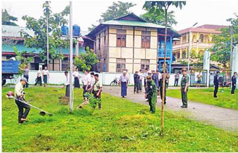
ရခိုင်ပြည်နယ်အတွင်း ဆိုင်ကလုန်းမုန်တိုင်း(မိုခါ)တိုက်ခတ်မှုကြောင့် ပျက်စီးမှုများ ဖြစ်ပေါ်ခဲ့သည့် ဒေသများ၌ ဒေသအလိုက် ခန့်အပ်တာဝန်ပေးသူများက သက်ဆိုင်ရာ တာဝန်ရှိသူများနှင့်အတူ ပြန်လည်ထူထောင်ရေးလုပ်ငန်းများ ကူညီဆောင်ရွက်ပေးစဉ်။

နေပြည်တော် ဇူလိုင် ၁၅ ဆိုင်ကလုန်းမုန်တိုင်း(မိုခါ) တိုက်ခတ်မှုကြောင့် ထိခိုက်ပျက်စီးခဲ့သည့် ဒေသများတွင် ပြန်လည်ထူထောင်ရေးလုပ်ငန်းများ ဆောင်ရွက်နိုင်ရန် ဒေသအလိုက် တပ်မတော်အရာရှိကြီးများကို ခန့်အပ်တာဝန်ပေးထားပြီးဖြစ်သည်။