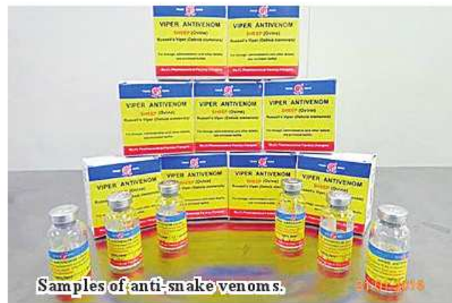
Samples of anti-snake venoms.

foreign technical assistance, the factory produced anti-snake venoms exceeding the target in 2016-17 financial year.