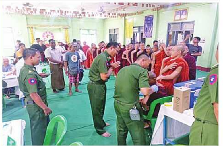
သံဃာတော်များအား နယ်လှည့်ဆေးကုသရေးအဖွဲ့က ကျန်းမာရေးစောင့်ရှောက်မှု လုပ်ငန်းဆောင်ရွက်ပေးနေမှုများကို တာဝန်ရှိသူများက ကြည့်ရှုအားပေးခဲ့ခြင်း။