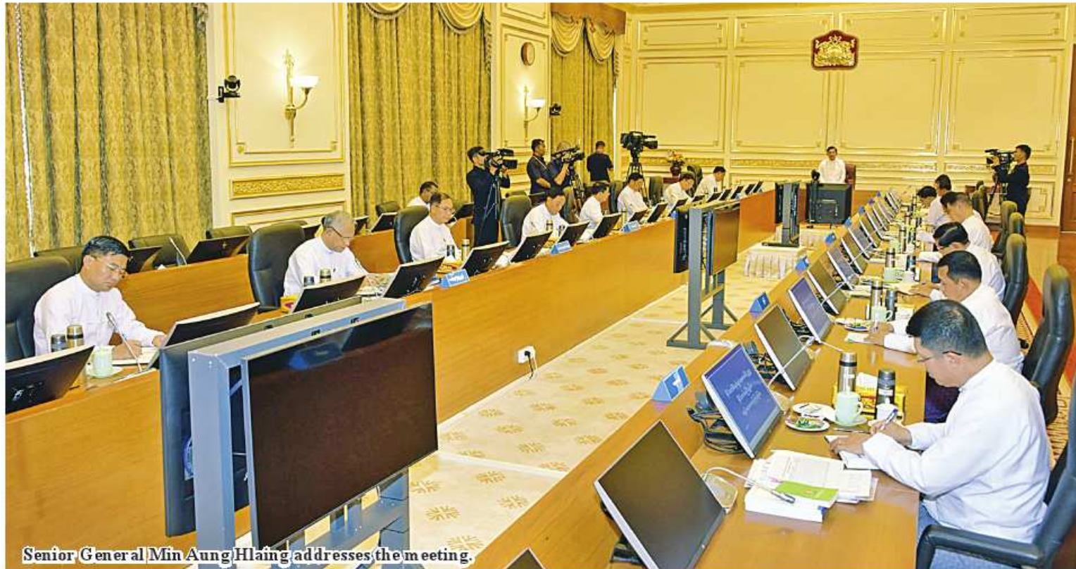
Senior General Min Aung Hlaing addresses the meeting.