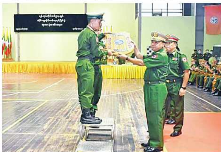
ရန်ကုန်တိုင်းစစ်ဌာနချုပ် တိုင်းမှူး ခိုင်းစစ်တုရင် ခိုင်းဆုပေးအပ်ချီးမြှင့်စဉ် နေပြည်တော် ဇူလိုင် ၁၅ တိုင်းမှူးခိုင်း စစ်တုရင်ပြိုင်ပွဲ ဆုပေးပွဲကို ရန်ကုန်တိုင်းစစ်ဌာနချုပ် ၂၀၂၃ ခုနှစ် ဇူလိုင် ၁၄ ရက်ညနေပိုင်းတွင် ရန်ကုန်တိုင်း

ဒေသကြီး မင်္ဂလာဒုံမြို့နယ်ရှိ တပ်မတော် ဆေးတက္ကသိုလ် အားကစားခန်းမ၌ ပြုလုပ်ရာ တိုင်းမှူး ခိုင်းစစ်တုရင် ဝင်ရောက်ကြည့်ရှုခဲ့ပြီး တာဝန်ရှိသူများ၊ အရာရှိ၊ စစ်သည်၊ မိသားစုဝင်များ၊ ခိုင်အဖွဲ့ဝင်များနှင့်ပြိုင်ပွဲ ဝင် အသင်းများ တက်ရောက်ကြသည်။ ယင်းနောက် တိုင်းမှူးနှင့် တာဝန်ရှိသူများက ခိုင်အဖွဲ့ဝင်များ၊ အသင်းလိုက်နှင့် တစ်ဦးချင်း ဆုရရှိကြသူများ၊ ခိုင်းဆုရရှိသော အသင်းတို့ကို တံခွန်စိုက် ခိုင်းဆုနှင့် ဂုဏ်ပြုဆုငွေများ အသီးသီးပေးအပ်ချီးမြှင့်ကြသည်။ အဆိုပါ စစ်တုရင်ပြိုင်ပွဲကို တိုင်းစစ်ဌာနချုပ် ကွပ်ကဲမှုအောက် တပ်နယ်များမှ ပြိုင်ပွဲဝင်အသင်း ၁၀ သင်း၊ ကစားသမား ဦးရေ ၅၀ တို့ဖြင့် ဇူလိုင် ၇ ရက်မှယနေ့ထိ ယှဉ်ပြိုင်ကစားခဲ့ကြကြောင်း သတင်းရရှိသည်။