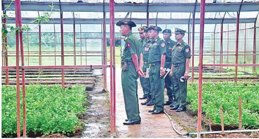
ကာကွယ်ရေး ဦးစီးချုပ်ရုံး(ကြည်း)မှ ဒုတိယဗိုလ်ချုပ်ကြီး ညွန့်ဝင်းဆွေ တောင်ညိုဘက်စိုက်ပျိုးရေးနှင့် မွေးမြူရေးခြံ၌ စိုက်ပျိုးရေးလုပ်ငန်းများကို ကြည့်ရှုစစ်ဆေးခဲ့ခြင်း။

မွေးမြူရေးခြံ၌ စိုက်ပျိုး၊ မွေးမြူရေး လုပ်ငန်းများကို သွားရောက်ကြည့်ရှု စစ်ဆေးပြီး တာဝန်ရှိသူများနှင့် တွေ့ဆုံ တာ ကုန်ထုတ်လုပ်မှုလုပ်ငန်းများ ရာနန်းပြည်အောင်မြင်အောင် ဆောင်ရွက်နိုင်ရေး လိုအပ်သည်များ ပေါင်းစပ် ညှိနှိုင်းဆောင်ရွက်ပေးခဲ့ကြောင်း သတင်း ရရှိသည်။