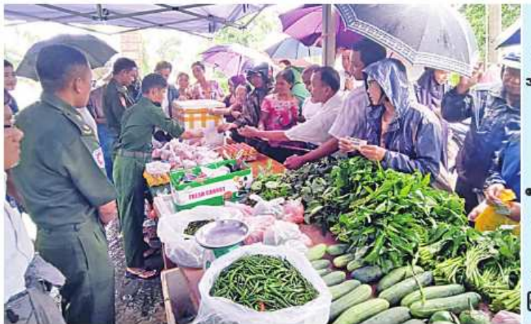
ရခိုင်ပြည်နယ် အတွင်းရှိ မုန်တိုင်းဒဏ်သင့်ပြည်သူများကို ဆန်၊ ဆီ၊ ဆား၊ ကြက်ဥ၊ ဟင်းသီးဟင်းရွက်များ၊ စားသောက်ကုန်ပစ္စည်းများနှင့် လူသုံးကုန်ပစ္စည်းများကို ဈေးနှုန်းသက်သာစွာဖြင့် ရောင်းချပေးစဉ်။

ထိုသို့ ရောင်းချပေးလျက်ရှိရာ ဒေသခံပြည်သူများနှင့် ဌာနဆိုင်ရာဝန်ထမ်းမိသားစုများက တစ်ခဲနက်ဝယ်ယူအားပေးကြကြောင်းနှင့် ယခုကဲ့သို့ စားရေးအစာအိမ်အခြေခံပေးနိုင်ရုံနှင့် သက်သာသောဈေးနှုန်းများဖြင့် ရောင်းချပေးမှုအပေါ် တာဝန်ရှိသူများကို အထူးပင်ကျေးဇူးတင်ရှိကြောင်း သတင်းရရှိသည်။