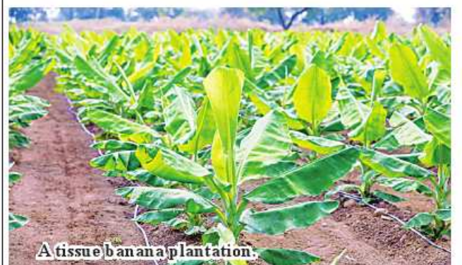
A tissue banana plantation.

Owl pea is cultivated as a cold season crop in Pakokky, Yesagyo, Monywa, Myingyan, Nyaung U, Kyaukse, Patheingyi, Madaya, Singu and Sinbyukyun located in the basins of Dokhtawady and Chin rivers. It can yield 35 baskets per acre. Farmers can harvest the pea as from early March.