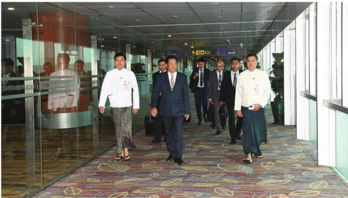
နိုင်ငံခြားရေးဝန်ကြီးဌာန ပြည်ထောင်စုဝန်ကြီး ဦးသန်းဆွေ ခေါင်းဆောင်သည့် မြန်မာကိုယ်စားလှယ်အဖွဲ့ကို နိုင်ငံခြားရေးဝန်ကြီးဌာနမှ တာဝန်ရှိသူများက ရန်ကုန်အပြည်ပြည်ဆိုင်ရာလေဆိပ်၌ ပို့ဆောင်နှုတ်ဆက်ကြစဉ်။

နေပြည်တော် စုလိုင် ၁၅ - ဝန်ကြီးဌာန ပြည်ထောင်စုဝန်ကြီး ရန် ယနေ့တွင် ထိုင်းနိုင်ငံသို့ ထွက်ခွာသွား လာအိုပြည်သူ့ဒီမိုကရက်တစ်သမ္မတ ဦးသန်းဆွေ ခေါင်းဆောင်သည့် မြန်မာ နိုင်ငံ ဒုတိယဝန်ကြီးချုပ်နှင့် နိုင်ငံခြားရေး ဝန်ကြီး ကိုမာဆစ်နှင့် ထိုင်းဘုရင့်နိုင်ငံ ကိုယ်စားလှယ်အဖွဲ့သည် (၁၂)ကြိမ်မြောက် မဲခေါင်-ဂင်္ဂါ ပူးပေါင်းဆောင်ရွက်မှု ဝန်ကြီး ဝန်ကြီးချုပ်နှင့် နိုင်ငံခြားရေး ဝန်ကြီး မစ္စတာဒွန်ပရာဗွတ်(၆)ဝိနိုင်ငံတို့၏ နိုင်ငံခြားရေးဝန်ကြီးများ အစည်းအဝေးနှင့် ဘင်းပင်စတတ် နိုင်ငံခြားရေးဝန်ကြီးများ၏ ပို့ဆောင်နှုတ်ဆက်ခဲ့ကြကြောင်း သတင်း သီးသန့်အစည်းအဝေးများသို့ တက်ရောက် ရရှိသည်။ (သတင်းစဉ်)