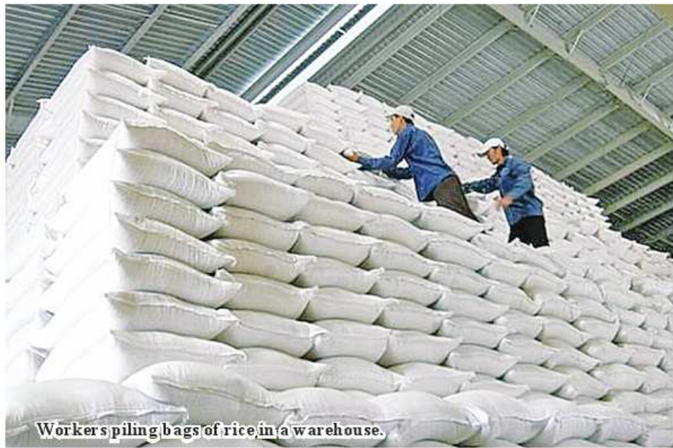
Workers piling bags of rice in a warehouse.

Depending on the local demand, Magway Region bought 33,553 bags of rice from Ayeyawady Region, 370 bags from Sagaing Region, 1,800 from Yangon Region, 2,355 from Bago Region, 910 from Mandalay Region, totalling 38,988 bags of rice weighing 1,949.4 tons.