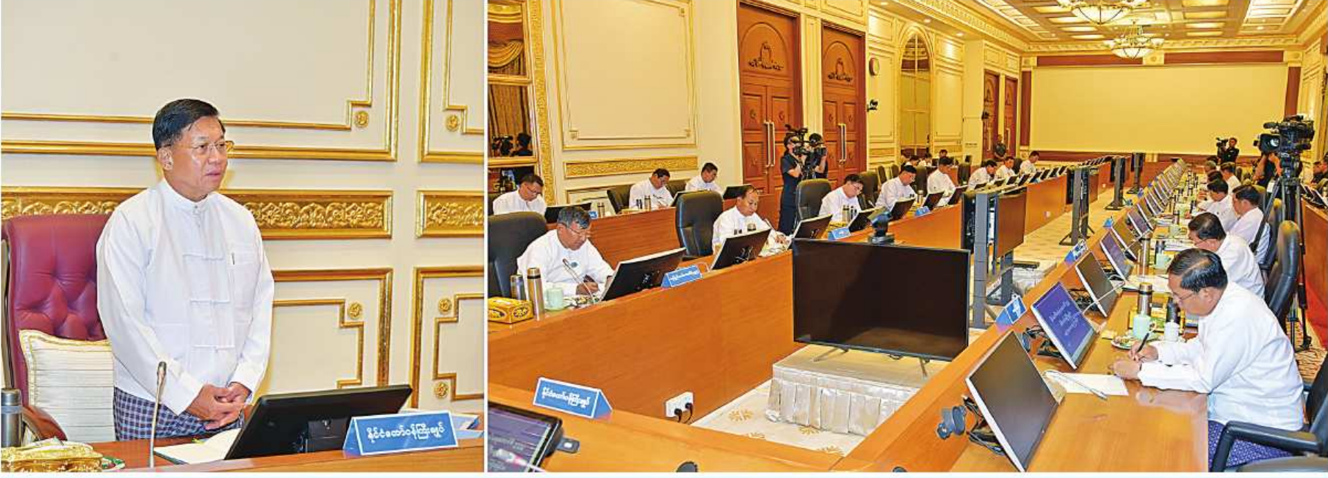
နိုင်ငံတော်စီမံအုပ်ချုပ်ရေးကောင်စီဥက္ကဋ္ဌ နိုင်ငံတော်ဝန်ကြီးချုပ် ဗိုလ်ချုပ်မှူးကြီးမင်းအောင်လှိုင် နိုင်ငံကုန်ထုတ်လုပ်မှုမြှင့်တင်ရေးအစည်းအဝေးတွင် အမှာစကားပြောကြားစဉ်။

နေပြည်တော် ၇ ဇူလိုင် ၁၅ အစည်းအဝေးသို့ ကောင်စီဝင် ဒုတိယဗိုလ်ချုပ်ကြီးမိုးမြင့်ထွန်း၊ ဒုတိယဝန်ကြီးချုပ်နှင့် ပြည်ထောင်စုဝန်ကြီး ဦးဝင်းရှိန်၊ နိုင်ငံတော်စီမံအုပ်ချုပ်ရေးကောင်စီဥက္ကဋ္ဌ၏ အကြံပေးပုဂ္ဂိုလ် ဒုတိယဗိုလ်ချုပ်ကြီးညိုစော၊ ပြည်ထောင်စုဝန်ကြီးများ၊ နေပြည်တော်ကောင်စီဥက္ကဋ္ဌ၊ တိုင်းဒေသကြီးနှင့်ပြည်နယ်အစိုးရအဖွဲ့များမှ ဝန်ကြီးချုပ်များ၊ ကာကွယ်ရေးဦးစီးချုပ်မှူးမှ အဆင့်မြင့်တပ်မတော်အရာရှိကြီးများနှင့် တာဝန်ရှိသူများ တက်ရောက်ကြသည်။ ဦးစွာ နိုင်ငံတော်စီမံအုပ်ချုပ်ရေးကောင်စီဥက္ကဋ္ဌ နိုင်ငံတော်ဝန်ကြီးချုပ် ဗိုလ်ချုပ်မှူးကြီးမင်းအောင်လှိုင်က အဖွင့်အမှာစကားပြောကြားရာ၌ ယနေ့အစည်းအဝေးတွင် လူဦးရေအရများပြားသည့် အဓိကသီးနှံများစိုက်ပျိုးထုတ်လုပ်သည့် မွေးမြူရေးလုပ်ငန်းများနှင့် MSME ကုန်ထုတ်လုပ်ငန်းများတွင် အားအကောင်းဆုံးဖြစ်သည့် တိုင်းဒေသကြီးနှင့်ပြည်နယ်များမှ ဝန်ကြီးချုပ်များကိုဖိတ်ခေါ်၍ အစည်းအဝေးတက်ရောက်စေခြင်းဖြစ်ကြောင်း၊ ယခုတက်ရောက်လာသည့် တိုင်းဒေသကြီး၊ ပြည်နယ်များနှင့် နေပြည်တော်ကောင်စီနယ်မြေတို့၏ စုစုပေါင်းလူဦးရေမှာ သန်း ၄၀ ကျော်(နိုင်ငံလူဦးရေ၏ ၅ ပုံ ၄ ပုံ)ရှိပြီး စာမျက်နှာ ၁၆ ကော်လံ ၁ ၂။