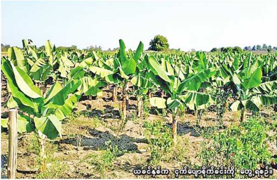
ယခင်နှစ်က ငှက်ပျောစိုက်ခင်းကို တွေ့ရစဉ်။