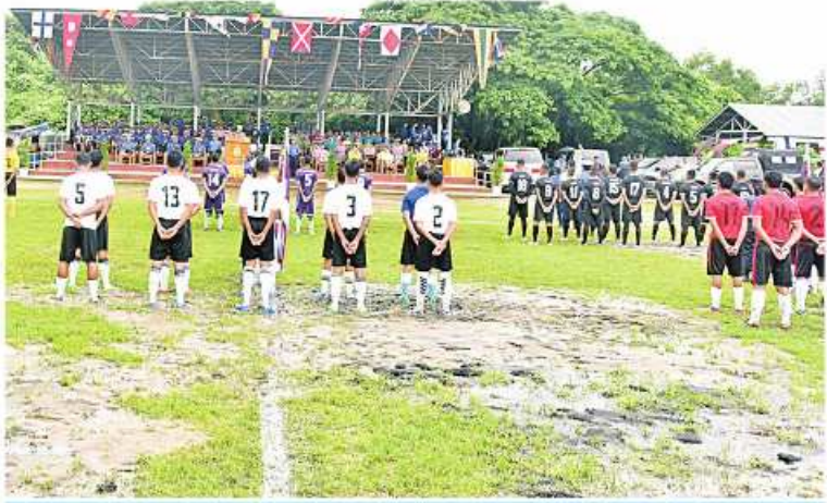
ကာကွယ်ရေးဦးစီးချုပ်(ရေ) တံခွန်စိုက်ပေးလားဘောလုံးပြိုင်ပွဲ ဖွင့်ပွဲပြုလုပ်စဉ်။

နေပြည်တော် ဇူလိုင် ၁၄ ၂၀၂၃ ခုနှစ် ကာကွယ်ရေးဦးစီးချုပ် (ရေ) တံခွန်စိုက်ပေးလားဘောလုံးပြိုင်ပွဲ တိုက်စား