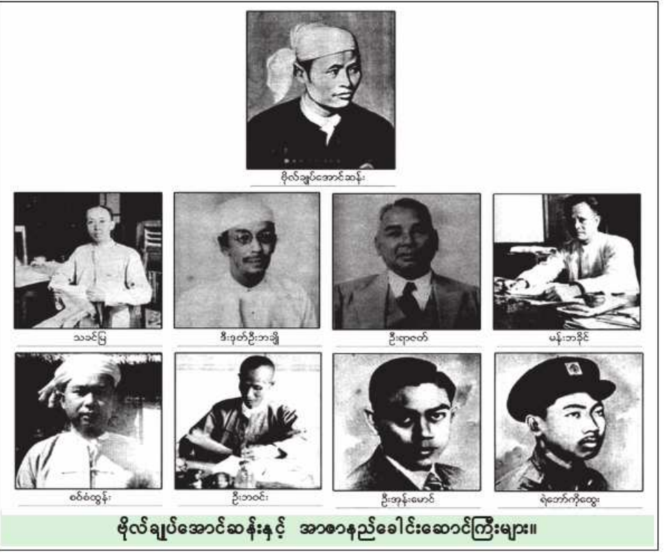
ဗိုလ်ချုပ်အောင်ဆန်းနှင့် အာဇာနည်ခေါင်းဆောင်ကြီးများ။

အထူးသဖြင့် မျိုးဆက်သစ်လူငယ်များအနေဖြင့် အာဇာနည်ခေါင်းဆောင်ကြီးများ၏ စွန့်လွှတ်စွန့်စားအနစ်နာခံလိုသော စိတ်နေစိတ်ထားကိုနှလုံးမူလျက် ကိုယ်ကျိုးစွန့်အနစ်နာခံကာ အများအကျိုးကို သယ်ပိုးနိုင်သည့် လူတော်လူကောင်းများ ဖြစ်လာအောင် ကြိုးစားအားထုတ်သွားရန်လိုအပ်ပေသည်။ မည်သို့ပင်ဆိုစေ အာဇာနည်ခေါင်းဆောင်ကြီးများသည် တိုင်းပြည်လွတ်လပ်ရေးအတွက် အသက်ပေးပေးကာ မထားဘဲ စွန့်လွှတ်စွန့်စား အနစ်နာခံသွားခဲ့သဖြင့် ပြည်သူများ၏နှလုံးသည်ပွတ်တွင် ထာဝစဉ်ရှင်သန်နေမည်ဟု ခိုင်မာစွာယုံကြည်မိပါတော့သည်။