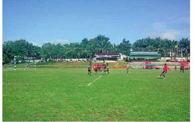
ကမ်းရိုးတန်းဒေသတိုင်းစစ်ဌာနချုပ် တိုင်းမှူးဒိုင်းဘောလုံးပြိုင်ပွဲ အဖွင့်ပွဲစဉ် အဖြစ် မြိတ်တပ်နယ်အသင်းနှင့် မြိတ်လေတပ်စခန်းဌာနချုပ်အသင်းတို့ ယှဉ်ပြိုင် ကစားနေမှုကို တွေ့ရစဉ်။

နေပြည်တော် ဇူလိုင် ၁၄ တက်ရောက်လာကြသူများက အဖွင့်ပွဲစဉ် ဖြစ်သည့် မြိတ်တပ်နယ်အသင်းနှင့် မြိတ် လေတပ်စခန်းဌာနချုပ် အသင်းတို့၏ ယှဉ်ပြိုင်ကစားနေမှုများကို ကြည့်ရှုအားပေး ကြသည်။ အဆိုပါ ဘောလုံးပြိုင်ပွဲကို တိုင်းစစ် ဌာနချုပ်ကွပ်ကဲမှုအောက် တပ်နယ်၊ တပ်ရင်း၊ တပ်ဖွဲ့များမှ ပြိုင်ပွဲဝင်အသင်း ရှစ်သင်းဖြင့် ဇူလိုင် ၃၁ ရက်ထိ ယှဉ်ပြိုင် ကစားသွားမည်ဖြစ်ကြောင်း သတင်း ရရှိသည်။ ဦးစွာ တိုင်းမှူးက အမှာစကားပြော ကြားသည်။ ထို့နောက် တိုင်းမှူးနှင့် > > >