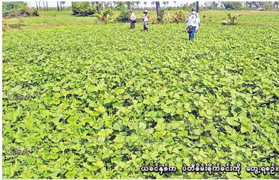
ယခင်နှစ်က ပဲတီစိမ်းစိုက်ခင်းကို တွေ့ရစဉ်။

ဧက၊ မိုးပဲတီစိမ်း ၁၅၀၇ ဧက၊ မတ်ပဲ ၁၁၇ ဧကနှင့် ပဲစင်းငုံ ၇၄၀၁ ဧက တို့ဖြစ်ကြောင်း၊ လျာထားမှုအနေဖြင့် မိုးကြိုပဲတီစိမ်း ၁၁၇၅၄ ဧက၊ မိုးပဲတီစိမ်းဧက ၅၅၀၀၊ မတ်ပဲ ၃၈၄ ဧက၊ ထောပတ်ပဲ ၂၈၅၄ ဧက၊ စွန်တာပြာ ၄၀၇၅ ဧက၊ ပဲစင်းငုံ ၁၃၀၃၆ ဧက၊ အခြားပဲ ၃၅ ဧက တို့ဖြစ်ကြောင်း သိရသည်။