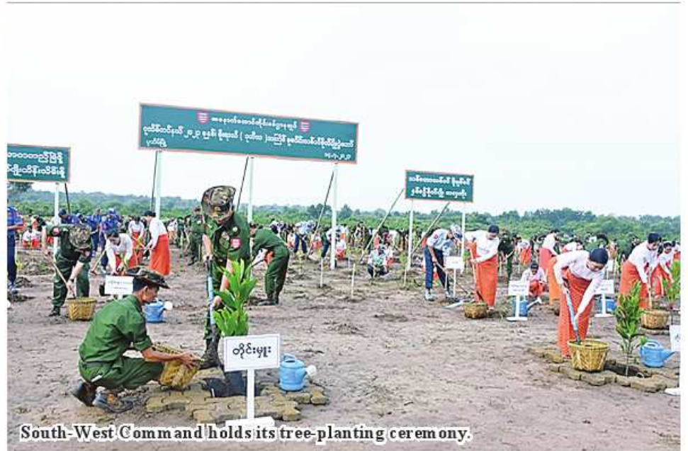
South-West Comm and holds its tree-planting ceremony.