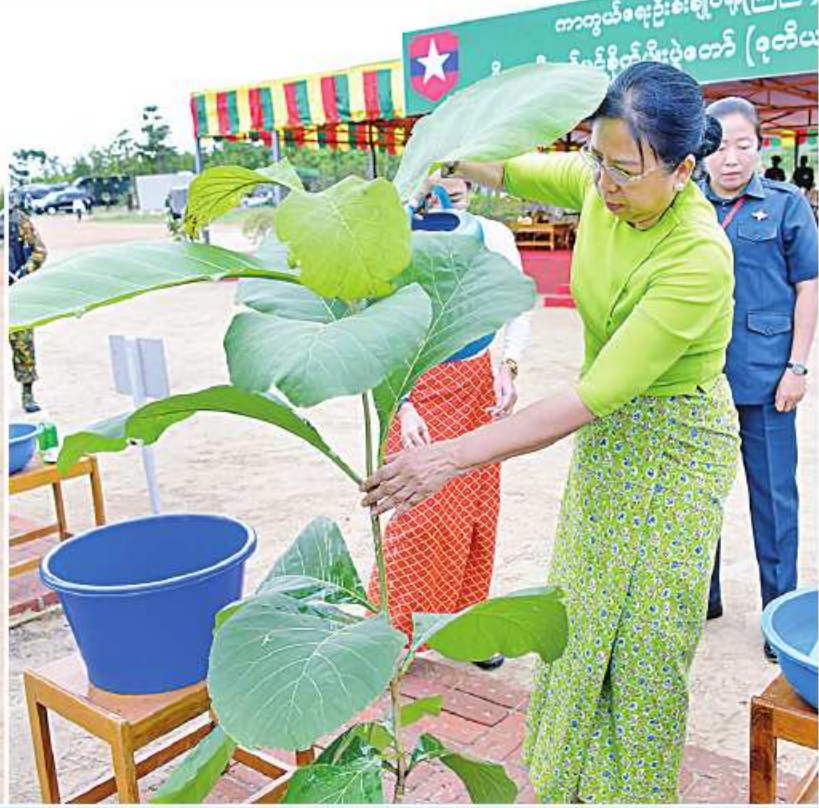
နိုင်ငံတော်စီမံအုပ်ချုပ်ရေးကောင်စီဥက္ကဋ္ဌ တပ်မတော်ကာကွယ်ရေးဦးစီးချုပ် ဗိုလ်ချုပ်မှူးကြီးမင်းအောင်လှိုင်နှင့် ဇနီး ဒေါ်ကြူကြူလှတို့က ရတနာတန်းဝင် ကျွန်းပင်ကို ဦးဆောင်စိုက်ပျိုးပေးစဉ်။

နေပြည်တော် ရုလိုင် ၁၄ သဘာဝပတ်ဝန်းကျင်အား ထိန်းသိမ်းနိုင်စေရန်နှင့် ရာသီဥတုကို အထောက်အကူဖြစ်စေရန်၊ အရိပ်အာဝါသရရှိစေရန်၊ နိုင်ငံစီးပွားရေးအတွက် တစ်ဖက်တစ်လမ်းမှ အထောက်အကူဖြစ်စေရန် ရည်ရွယ်၍ ကာကွယ်ရေးဦးစီးချုပ်ရုံး(ကြည်း၊ ရေ