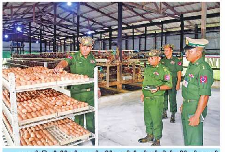
အနောက်မြောက်တိုင်းစစ်ဌာနချုပ် တိုင်းမှူး ဗိုလ်ချုပ်သန်းထိုက် တိုင်းစစ်ဌာနချုပ် ၌ စိုက်ပျိုးမွေးမြူရေးလုပ်ငန်း ဆောင်ရွက်ထားရှိမှုများကို ကြည့်ရှုစစ်ဆေးစဉ်။

နေပြည်တော် ဇူလိုင် ၁၄ တိုင်းမှူး ဗိုလ်ချုပ်သန်းထိုက်နှင့် တာဝန်ရှိ သူများက တိုင်းစစ်ဌာနချုပ် ပေါင်းစည်း လယ်ယာရှိ စိုက်ပျိုးရေး၊ မွေးမြူရေးလုပ်ငန်း များ ဆောင်ရွက်ထားရှိမှုများကို သွား ရောက်ကြည့်ရှုစစ်ဆေးပြီး တာဝန်ရှိသူ များနှင့်တွေ့ဆုံကာ ကုန်ထုတ်လုပ်မှု စစ်ဌာနချုပ်များ၊ တပ်ရင်း၊ တပ်ဖွဲ့များ၌ စိုက်ပျိုး၊ မွေးမြူရေးလုပ်ငန်းများကို ဆောင်ရွက်လျက်ရှိသည်။ ထိုသို့ဆောင်ရွက်လျက်ရှိရာ ယနေ့ သတင်းရရှိသည်။