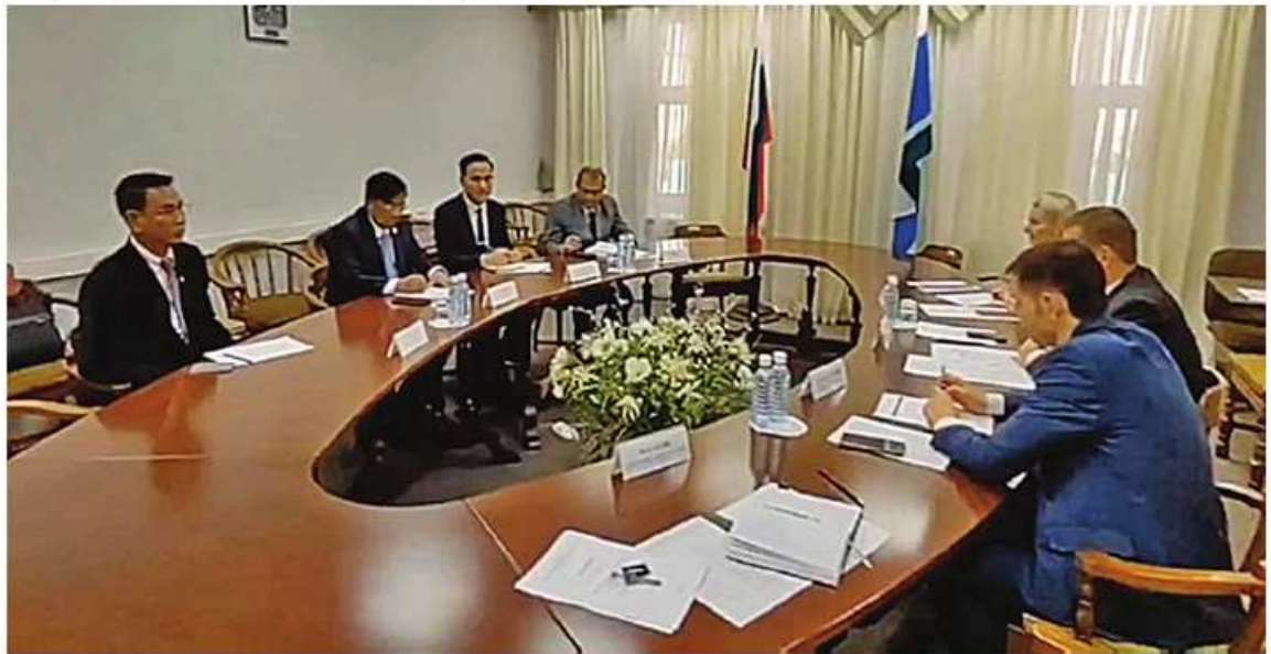
ပြည်ထောင်စုဝန်ကြီး ဒေါက်တာချာလီသန်း စပျဲလော်ပိစ်ဒေသ၏ နိုင်ငံတကာစီးပွားရေးဆက်သွယ်ဆောင်ရွက်မှုဝန်ကြီးဌာန ဝန်ကြီး မစ္စတာဖျဲချီးစ်လာဖ်ယာရင် ဦးဆောင်သော ဒေသအစိုးရအဖွဲ့နှင့် တွေ့ဆုံဆွေးနွေးစဉ်။

အဆင့်ဆင့်တို့ကို ကျွမ်းကျင်တတ်မြောက်၍ ကိုယ်တိုင်ထုတ်လုပ်မှုလုပ်ငန်းများ ဆောင် ရွက်နိုင်သည့်အထိ လေ့ကျင့်သင်ကြားပေး ခြင်းဆိုင်ရာကိစ္စရပ်များ၊ မြန်မာနိုင်ငံမှ ကျောင်းသားများကို ယူရယ်ဒေသရှိ အဆင့် မြင့်တက်သို့လေ့ကျင့်ပညာပေးပေးသည့် စေလွှတ်ခြင်းဖြင့် လူ့စွမ်းအားအရင်းအမြစ် တည်ဆောက်ခြင်းဆိုင်ရာ ကိစ္စရပ်များ၊ မိတ်ဖက်နိုင်ငံများအကြား ညီရင်းအစ်ကို စိတ်ဓာတ်ဖြင့် စည်လုံးညီညွတ်မှုပိုမိုခိုင်မြဲ စေသည့် အကြောင်းအရာများနှင့် စပျဲ လော်ပိစ်ဒေသအနေဖြင့် စီးပွားရေး၊ ကုန် သွယ်ရေးသံတမန်များ ခန့်အပ်စေလွှတ် သွားနိုင်မည့်အလားအလာများကို ရင်းနှီး ပွင့်လင်းစွာဆွေးနွေးကြပြီး အမှတ်တရ လက်ဆောင်ပစ္စည်းများ အပြန်အလှန်ပေး အပ်ခဲ့ကြောင်း သတင်းရရှိသည်။ (သတင်းစဉ်)