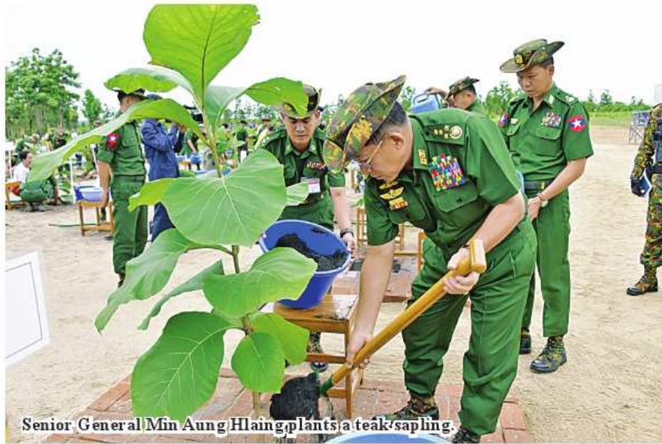
Senior General Min Aung Hlaing plants a teak sapling.

Nay Pyi Taw July 14 Aimed at conserving environment and contributing to the climatic conditions, giving shade to the people and supporting the State economy on one hand, families of the Office of the Commander-in-Chief (Army, Navy and Air) and relevant military commands have been holding monsoon tree-growing ceremonies annually since 2011.