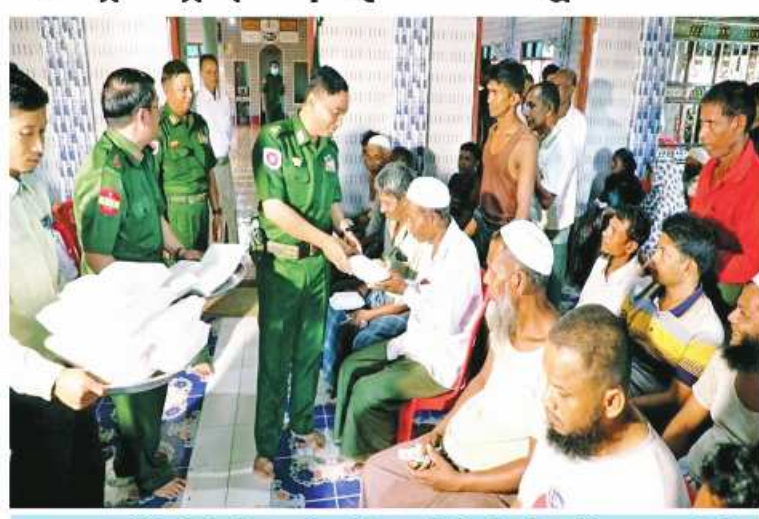
အနောက်ပိုင်းတိုင်းစစ်ဌာနချုပ် တိုင်းမှူး ဗိုလ်ချုပ်ထင်လတ်ဦး ဒေသခံပြည်သူ များကို အာဟာရဖြည့်စားသောက်ဖွယ်ရာများ ပေးအပ်စဉ်။

နေပြည်တော် ဇူလိုင် ၁၄ ရခိုင်ပြည်နယ် စစ်တွေမြို့နယ် ဒုံးပြင် တောင်ကျေးရွာနှင့် ပတ်ဝန်းကျင်ကျေးရွာ များရှိ မုန်တိုင်းသင့် ဒေသခံပြည်သူများနှင့် ကျောင်းသား၊ ကျောင်းသူများကို ယနေ့ တွင် ကာကွယ်ရေးဦးစီးချုပ်(ကြည်း) ဆေးဝန်ထမ်းညွှန်ကြားရေးမှူးရုံး ကွပ်ကဲမှု အောက်ရှိ အထူးဆေးကုသရေးအဖွဲ့၊ အနောက်ပိုင်းတိုင်းစစ်ဌာနချုပ်မှ နယ်လှည့် ဆေးကုသရေးအဖွဲ့နှင့် ကျန်းမာရေး ဦးစီးဌာနမှ ကျန်းမာရေးဝန်ထမ်းများက အဆိုပါကျေးရွာ၌ ကျန်းမာရေးစောင့်ရှောက် မှု လုပ်ငန်းများဆောင်ရွက်ပေးသည်။ ထိုသို့ ဆောင်ရွက်ပေးလျက်ရှိရာ ဆေးကုသရေးအဖွဲ့က အဆိုပါကျေးရွာနှင့် ပတ်ဝန်းကျင်ကျေးရွာများရှိ မုန်တိုင်းသင့် ဒေသခံပြည်သူများနှင့် ကျောင်းသား၊ ကျောင်းသူများကို အများရောဂါ၊ သွေးတိုး ရောဂါ၊ ဝမ်းပျက်ဝမ်းလျှော့ရောဂါ၊ အရိုးအကြောရောဂါ၊ နား၊ နှာခေါင်း၊ လည်ချောင်းရောဂါ၊ ကလေးရောဂါ၊ အထွေထွေရောဂါတို့နှင့် ပတ်သက်၍ လိုအပ်သည့် ကျန်းမာရေးစောင့်ရှောက်မှု