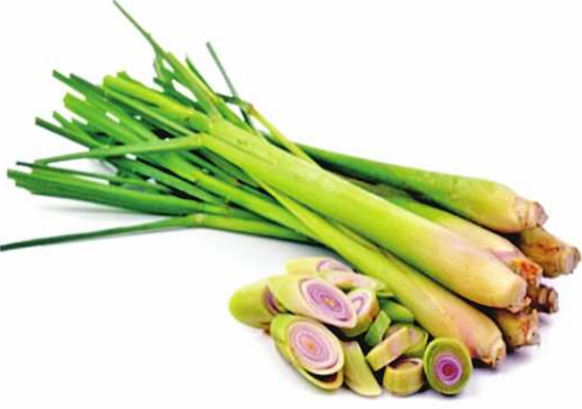
ဆေးဖက်ဝင် စပါးလင်ကို တွေ့ရစဉ်။

ဖြေ ။ ။ ဗေလုံးရောဂါဟာ ငှက်ဖျားရောဂါကြောင့် ဝါမှမဟုတ် အခြားသွေးရောဂါတစ်ခုခုကြောင့် သွေးနီဥတွေပျက်စီးတာများတဲ့ရောဂါလို့ဆိုပါတယ်။ ပျက်စီးသွားတဲ့သွေးနီဥတွေကို သိုလှောင်ပေးရင်း သရက်ရွက်ကြီးလာတာကို ဗေလုံးကြီးတယ်လို့ ခေါ်ကြပါတယ်။ မတော်တဆ ထိခိုက်မိရင်တောင် ဗေလုံးကွဲပြီးဝမ်းပိုက်အတွင်းမှာ သွေးယိုစီးတာဖြစ်နိုင်လို့ ဗေလုံးရှိသူကို မကန်မိအောင်၊ မှောက်လျက်ချော်မလဲအောင် အထူးဂရုစိုက်ရပါတယ်။ တိုင်းရင်းဆေးနည်းတွေမှာ ဗေလုံးကိုသက်သာစေနိုင်တဲ့ အောက်ပါနည်းလမ်းတွေကို မှတ်သားထားရဖူးပါတယ်။ ၁။ ငှက်ဖျားကို ထန်းလျက်နဲ့ ရောကျိုပြီး အကြမ်းပန်းကန်တစ်လုံးစာ မနက်၊ ညသောက်ပါ။ ၂။ ဗေလုံးကြီးရင် ကြက်အမြစ်ကို ပင်စိမ်းနဲ့ ရောချက်စားပါ။ ၃။ စပါးလင်ကိုထောင်း အရည်ညှစ်ယူ ဟင်းစားဖွန်းတစ်ဖွန်း ပျားရည်တစ်ဖွန်းနဲ့ စပ်သောက်ပါ။ ဗေလုံးအောင့်တာ သက်သာစေနိုင်ပါတယ်။ ၄။ ရှားစောင်းလက်ပပ်အနှစ်ကိုကျိုချက်ထားတဲ့ပုတ်ခါးကို ပျားရည်၊ ထန်းလျက်တို့နဲ့ ကျိုသောက်ရင် ဗေလုံးကြီးတာကို သက်သာစေနိုင်ပါတယ်။ ၅။ ရှမ်းဆေးခါးပင် အစိုဖြစ်ဖြစ်၊ အခြောက်ဖြစ်ဖြစ် ထန်းလျက်နဲ့ ရောကျိုပြီး အကြမ်းပန်းကန်တစ်လုံးစာ တစ်လလောက် နေစဉ်စွဲသောက်ပေးပါ။ ဗေလုံးအောင့်ရောဂါသက်သာစေပါတယ်။ ၆။ ရှိန်းခိုကို နှစ်ပဲသားလောက် နေ့စဉ်မျှချပေးရင် ငှက်ဖျားကြောင့်ဖြစ်တဲ့ ဗေလုံးကြီးရောဂါကို သက်သာပျောက်ကင်းစေနိုင်ပါတယ်။