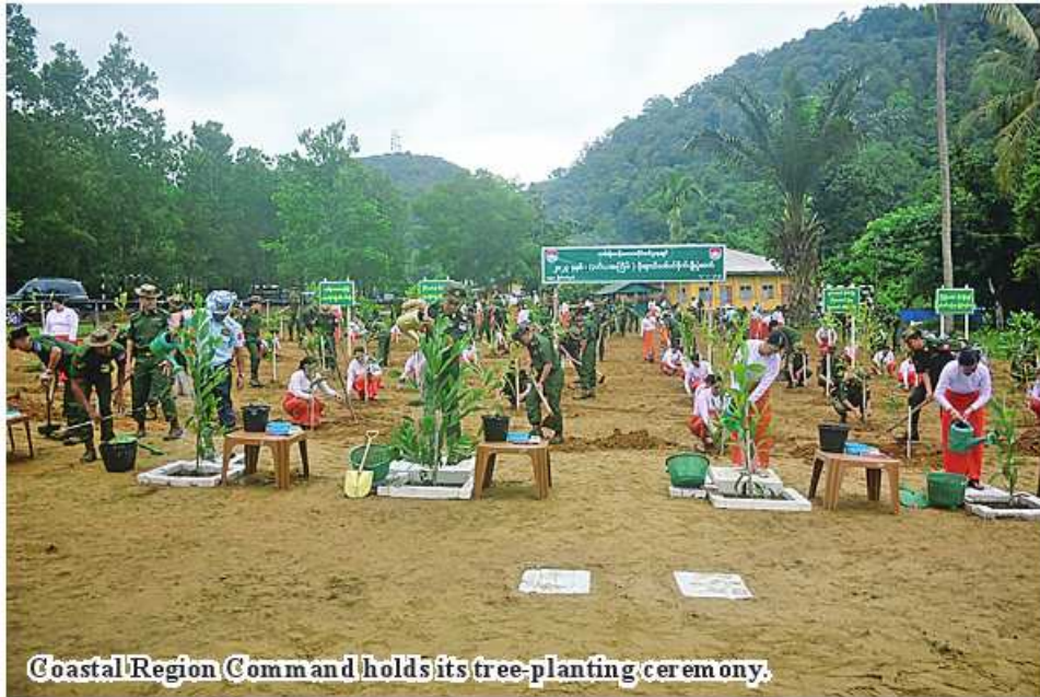
Coastal Region Command holds its tree-planting ceremony.