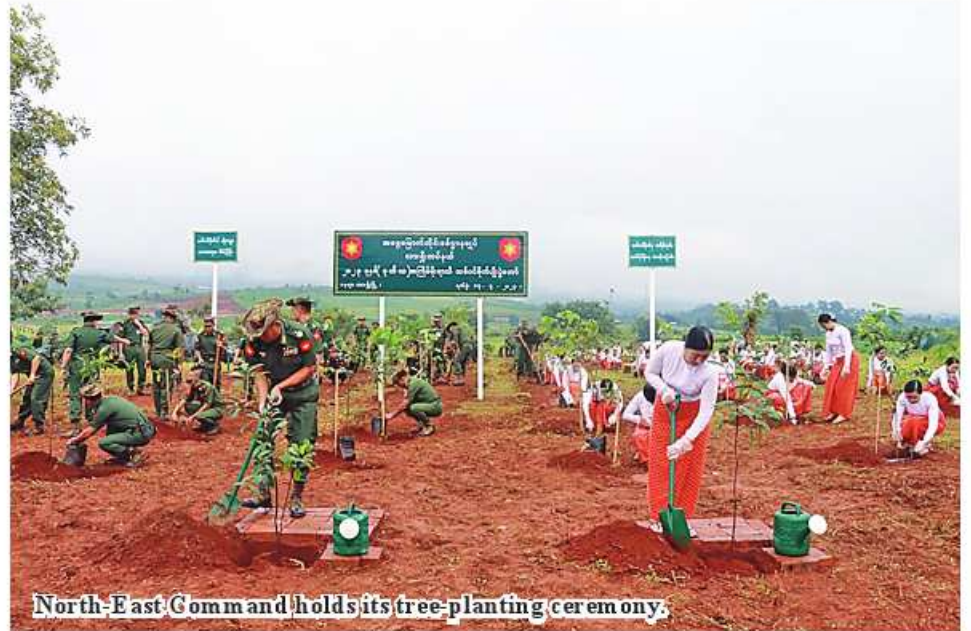
North-East Comm and holds its tree-planting ceremony.

From Page 12 Command 14,322 trees, South-Eastern Central Command 13,273 trees, Triangle Region Command 21,999 trees, Yangon Command 17,286 trees, South-West Command 7,195 trees, Western Command 15,962 trees, North-West Command 8,713 trees, Central Command 35,247 trees and Southern Command 13,200 trees. Today, the whole Tatmadaw planted 227,202 trees. 100