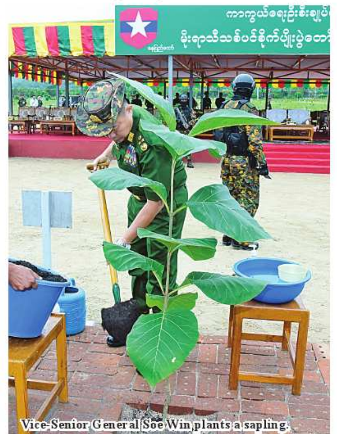
Vice-Senior General Soe Win plants a sapling.