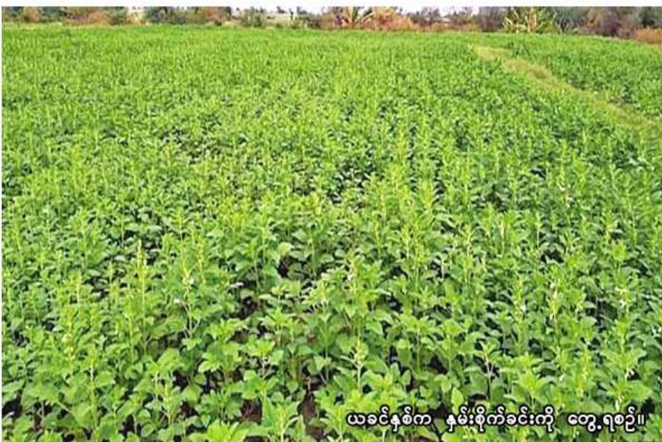
ယခင်နှစ်က နှမ်းစိုက်ခင်းကို တွေ့ရစဉ်။