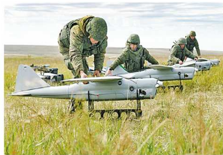
Orlan drone supplies skyrocketing — Russian defense minister ကို အာသာပြန်ဆိုထားပါသည်။

ကြောင်းချီတပ်ဖွဲ့နှင့် လေကြောင်းနှင့် အာကာသတပ်ဖွဲ့တို့က ပေါင်းစည်း၍ ကြိုတင်လက်ဦးမှုရယူကာ တီကျပ်ထိန်းလက်နက်များ၊ တိုက်ခိုက်ရေးဒရုန်းများ အသုံးပြုလျက် လေကြောင်းတိုက်ခိုက်မှုများဖြင့် ရန်သူစစ်ရေးစွမ်းအားများကို တိုက်ခိုက်ချေမှုန်းလျက်ရှိသည် စစ်နည်းဗျူဟာမှာ များစွာထိရောက်အကျိုးရှိလျက် ရှိသည်ကို တွေ့ရှိရသည်။ တစ်ချိန်တည်းတစ်ပြိုင်တည်း တိုက်စွမ်းအားများ ပြန်လည်ဖြည့်တင်းရာတွင် ကာကွယ်ရေးဆိုင်ရာ စက်မှုလုပ်ငန်းစုများ၏ ထုတ်ကုန်စွမ်းဆောင်ရည်များပါ တိုးတက်မြှင့်မားလာလျက်ရှိသည်ကို ရုရှားနိုင်ငံ ကာကွယ်ရေးဝန်ကြီး Shoigu က မီးမောင်းထိုးပြခဲ့ခြင်းဖြစ်သည်။