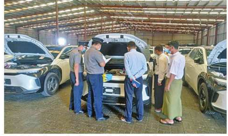
လျှပ်စစ်သုံးယာဉ်အားသွင်းစက်များ တင် ပြုထားကြောင်း သတင်းရရှိသည်။ သွင်းမှုအတွက် အကောက်ခွန်ကင်းလွတ်ခွင့် (သတင်းစဉ်)

လျှပ်စစ်သုံးမော်တော်ယာဉ်များနှင့် လျှပ်စစ်သုံးယာဉ်အားသွင်းစက်များ ရန်ကုန်ဆိပ်ကမ်းသို့ရောက်ရှိ နေပြည်တော် ဇူလိုင် ၁၄ အမျိုးသားအဆင့် လျှပ်စစ်သုံးယာဉ်နှင့် ဆက်စပ်လုပ်ငန်းများ ဖွံ့ဖြိုးတိုးတက်ရေး ဦးဆောင်ကော်မတီ၏ ခွင့်ပြုချက်ဖြင့် Amazing Auto Co., Ltd က တင်သွင်း လာသော Faw Toyota BZ4X အမျိုး အစား လျှပ်စစ်သုံးမော်တော်ယာဉ် ၃၇ စီး နှင့် Grand Sinus Co.,Ltd က တင် သွင်းလာသော လျှပ်စစ်သုံးယာဉ်အားသွင်း စက် (EV Charger, 60KW) အခု ၃၀ သည် ရန်ကုန်ဆိပ်ကမ်းသို့ ရောက်ရှိလာ သဖြင့် ယနေ့တွင် လုပ်ထုံးလုပ်နည်းနှင့် အညီ ထုတ်ယူခွင့်ပြုခဲ့ကြောင်းနှင့် အဆိုပါ လျှပ်စစ်သုံးမော်တော်ယာဉ်နှင့်