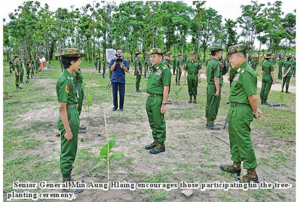
Senior General Min Aung Hlaing encourages those participating in the tree-planting ceremony.

of precious trees, industrial crops, perennial trees, shade plants and windbreaks. In this regard, Nay Pyi Taw