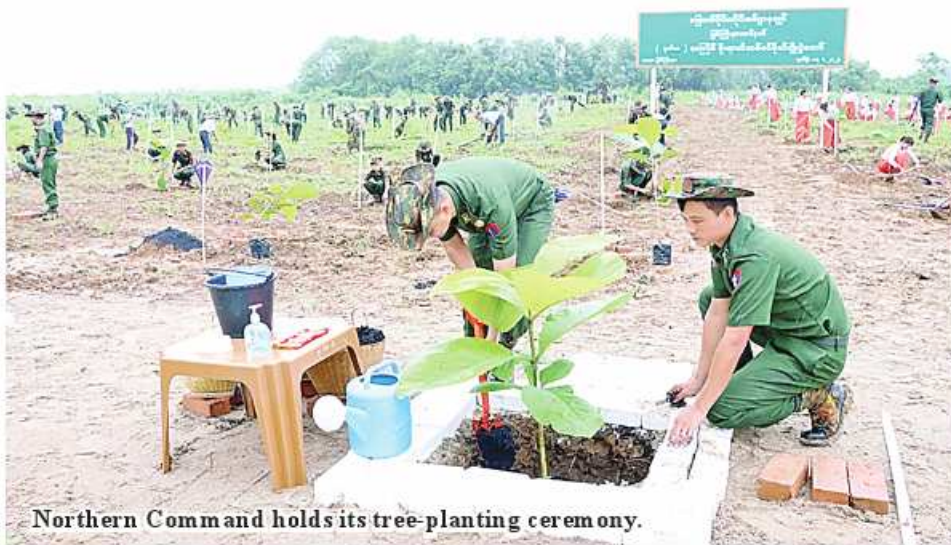
Northern Comm and holds its tree-planting ceremony.