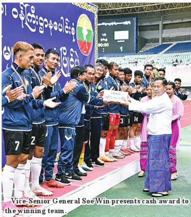
Vice-Senior General Soe Win presents cash award to the winning team.

Nay Pyi Taw July 4 The final match of the 2023 football tourney of universities of various minis-