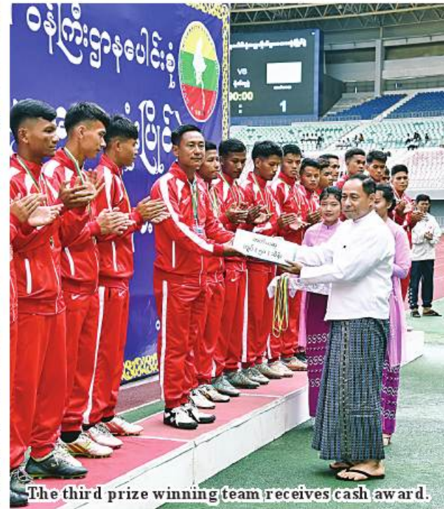
The third prize winning team receives cash award.

manent secretaries, directors general, rectors, deputy directors general, See Page 13