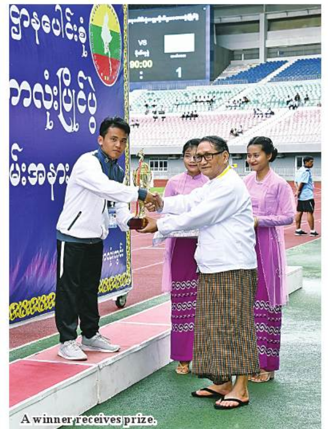
A winner receives prize.