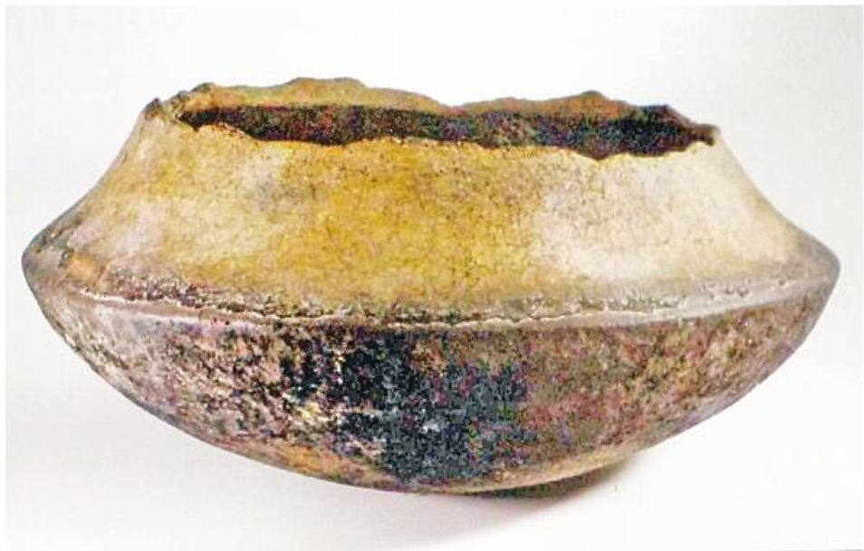
တနင်္သာရီယဉ်ကျေးမှုအထောက်အထား အိုးကွဲစများကို တွေ့ရစဉ်။

ပိုးလမ်းမလမ်းကြောင်းမှတစ်ဆင့် ကုန်သွယ်ရေး၊ စီးပွားရေး၊ လူမှုရေးတို့ တိုးတက်လာခဲ့ကာ တစ်နေရာမှတစ်နေရာ ကူးလူးဆက်ဆံမှုများကြောင့် ကိုယ်ပိုင်ယဉ်ကျေးမှုများ ပေါ်ထွန်းခဲ့သည်။ ပိုးလမ်းမတစ်လျှောက် ရွှေပြောင်းနေထိုင်မှုများလည်း ဖြစ်ပေါ်ခဲ့သည်။