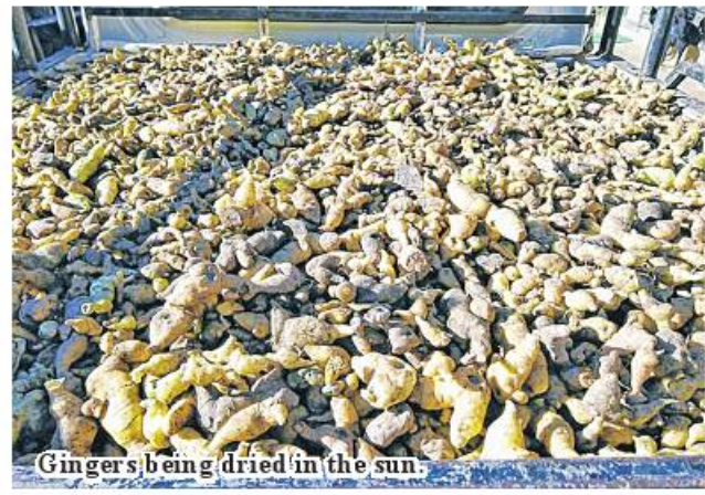
Gingers being dried in the sun.

Currently, as demand of ginger from Bangladesh and other countries is high, prices of ginger lead to the upward trend in the market. 336