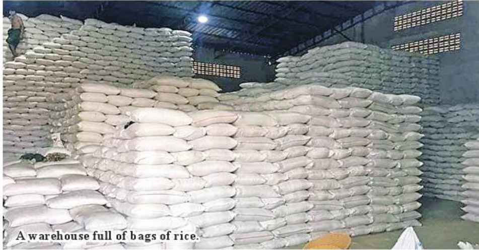
A warehouse full of bags of rice.

Yangon July 4 The Myanmar Rice Federation decided to implement the system for farmers to take out loans from banks after handing over crops to the warehouses, said president U Ye Min Aung of the federation. The Myanmar Rice Con-