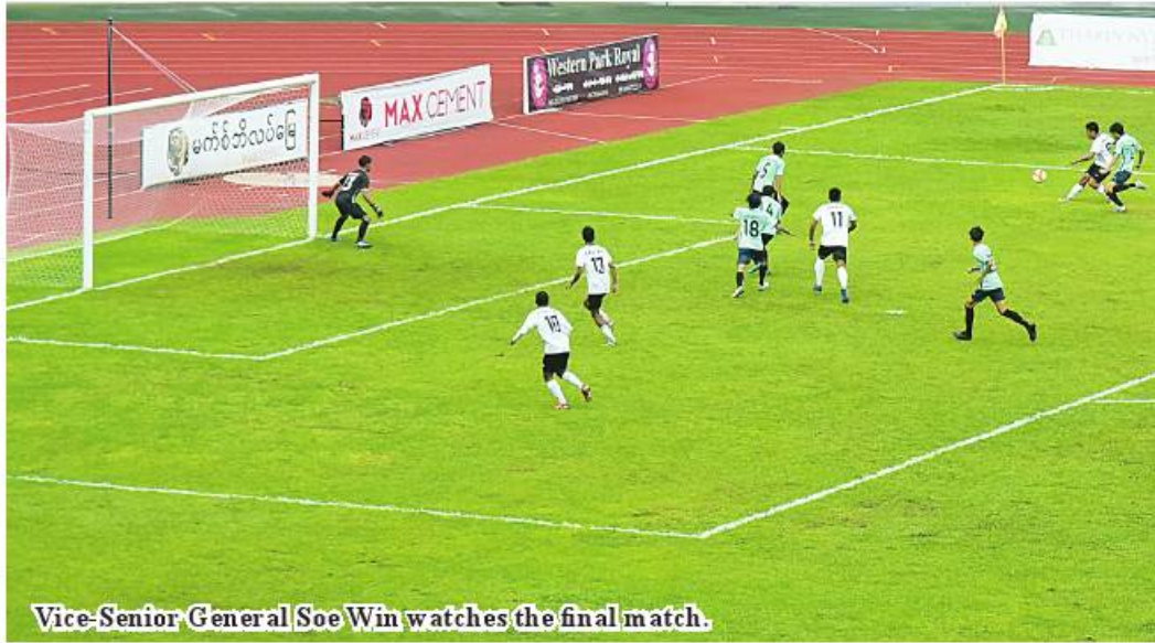
Vice-Senior General Soe Win watches the final match.