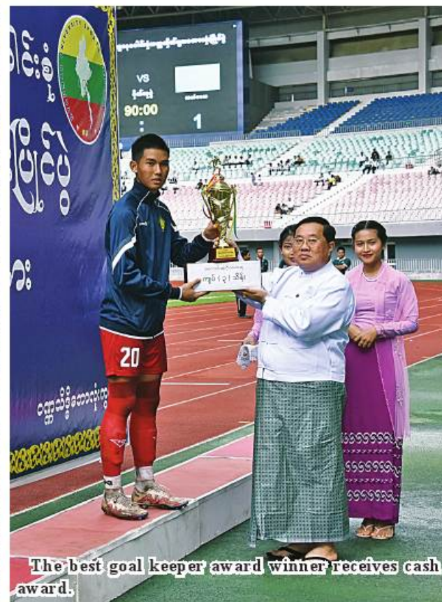
The best goal keeper award winner receives cash award.