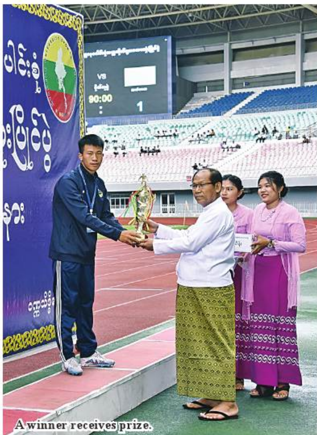
A winner receives prize.