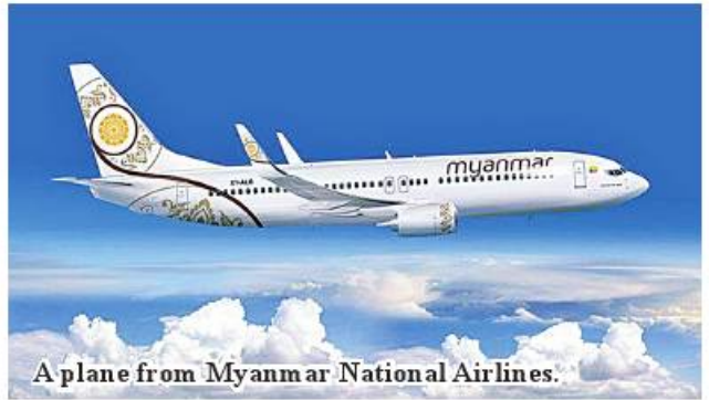
A plane from Myanmar National Airlines.