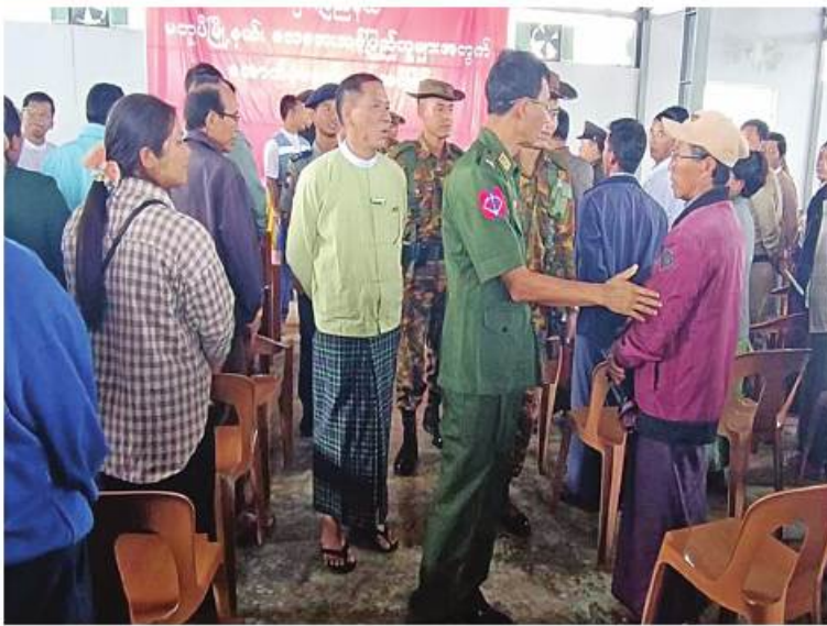
ဗိုလ်မှူးချုပ်ခင်မောင်အေး လေဘေးသင့်ပြည်သူများကို ရင်းရင်းနှီးနှီး နှုတ်ဆက်စဉ်။

နေမှုကိုသွားရောက်ကြည့်ရှုပြီး စားသောက်ဖွယ်ရာများပေးအပ်သည်။ ထို့အတူ မတူပီမြို့သို့ ရောက်ရှိနေသော ဗိုလ်မှူးချုပ်ခင်မောင်အေးနှင့် ဌာနဆိုင်ရာတာဝန်ရှိသူများသည် နယ်မြေခံတပ်နယ်ခန်းမ၌ လေဘေးသင့်ပြည်သူများထံ အဝတ်အထည်မျိုးစုံနှင့် အသုံးအဆောင်ပစ္စည်းများကို ထောက်ပံ့ပေးအပ်သည်။ အလားတူ ပုဏ္ဏားကျွန်းမြို့သို့ရောက်ရှိနေသော ဗိုလ်မှူးချုပ်ဝင်းမောင်သည် ဌာနဆိုင်ရာတာဝန်ရှိသူများနှင့်အတူ မြို့မပရိယတ္တိဘုန်းတော်ကြီးကျောင်းရွှေတောင်တန်းဘုန်းတော်ကြီးကျောင်းနှင့်ခေမာရာမပရဟိတဘုန်းတော်ကြီးကျောင်းတို့သို့သွားရောက်၍ ဆရာတော်ကြီးများကို ဖူးမြော်ကြည့်ညိပြီး သံဃာတော်များအတွက် သက်ဆိုင်ရာများ၊ စားသောက်ကုန်ပစ္စည်းများ