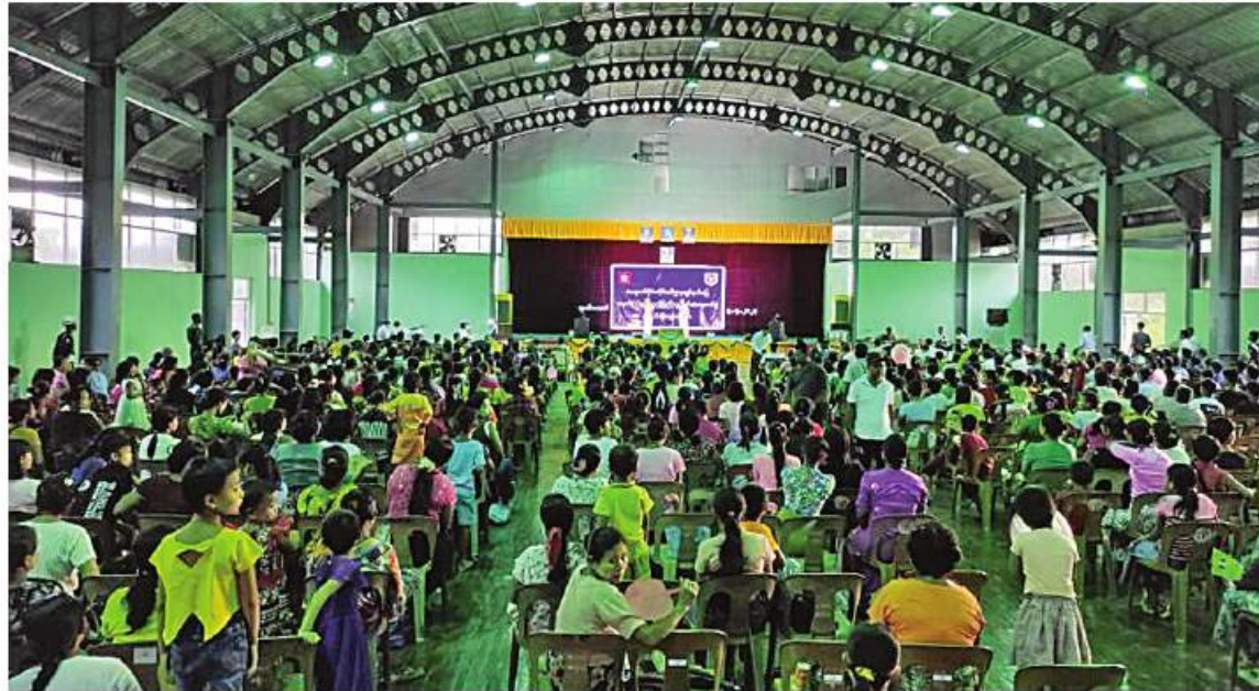
ရခိုင်ပြည်နယ်အတွင်း မိုခါမုန်တိုင်းသင့်ဒေသများတွင် ပြန်လည်ထူထောင်ရေးလုပ်ငန်းများ ဆောင်ရွက်လျက်ရှိသည့် နယ်မြေခံတပ်မတော်သားများ၊ မြန်မာနိုင်ငံရဲတပ်ဖွဲ့ဝင်များ၊ မီးသတ်တပ်ဖွဲ့ဝင်များနှင့် မိသားစုဝင်များကို နယ်လှည့်ပြည်သူ့ဆက်ဆံရေးတပ်ဖွဲ့မှ ဆက်လက်ကပြသီဆိုဖျော်ဖြေစဉ်။

နေပြည်တော် စုလိုင် ၄ - ရခိုင်ပြည်နယ်အတွင်းရှိ မိုခါမုန်တိုင်းဒဏ်သင့်ဒေသများတွင် ပြန်လည်ထူထောင်ရေးလုပ်ငန်းများ ဆောင်ရွက်လျက်ရှိသည့် နယ်မြေခံတပ်မတော်သားများ၊ မြန်မာနိုင်ငံရဲတပ်ဖွဲ့ဝင်များ၊ မီးသတ်တပ်ဖွဲ့ဝင်များနှင့် မိသားစုဝင်များကို စိတ်ချမ်းသာစေရန်နှင့် ပင်ပန်းနွမ်းနယ်မှုများ ပြေပျောက်စေရန်အတွက် ယနေ့ညနေပိုင်းတွင် ဘူးသီးတောင်တပ်နယ်ရှိ နယ်မြေခံတပ်မတော်သားများနှင့် မိသားစုဝင်များအား နယ်လှည့်ပြည်သူ့ဆက်ဆံရေးတပ်ဖွဲ့မှ ဆက်လက်ကပြသီဆိုဖျော်ဖြေစဉ်။ ဆက်ဆံရေးနှင့် စိတ်ဓာတ်စစ်ဆင်ရေး ဖြင့် ကဏ္ဍစုံလင်စွာသီဆိုကပြဖျော်ဖြေကြရာ နယ်မြေခံတပ်မတော်အရာရှိကြီးများ၊ စစ်သည်၊ မိသားစုဝင်များ၊ ဌာနဆိုင်ရာဝန်ထမ်းများ၊ မြန်မာနိုင်ငံရဲတပ်ဖွဲ့ဝင်များ၊ မီးသတ်တပ်ဖွဲ့ဝင်များနှင့် မိသားစုဝင်များ ပျော်ရွှင်စွာကြည့်ရှုအားပေးကြသည်။ ထိုသို့ဖျော်ဖြေတင်ဆက်ရာတွင် စစ်သည်၊ စစ်သမီးများက မြန်မာသံစဉ် တေးသီချင်းများ၊ ခေတ်ပေါ်တေးသီချင်း အဆို၊ အက၊ ထိုသို့ သီဆိုကပြဖျော်ဖြေသော စစ်သည်၊ စစ်သမီးများကို နယ်မြေခံတပ်မတော်မှ တာဝန်ရှိသူတို့က ဆုငွေများ အသီးသီးပေးအပ်ချီးမြှင့်ခဲ့ကြောင်း သတင်းရရှိသည်။