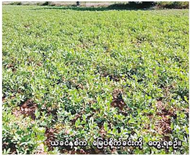
ယခင်နှစ်က မြေပဲစိုက်ခင်းကို တွေ့ရစဉ်။

ဖြစ်ထွန်းရန်၊ ပိုးမွှားရောဂါကျရောက်မှု မရှိစေရန်၊ ပေါင်းမြက်ကင်းစင်စေရန်အတွက် စိုက်ခင်းများအတွင်း ကွင်းဆင်းစစ်ဆေးပြီး ကင်းထောက်