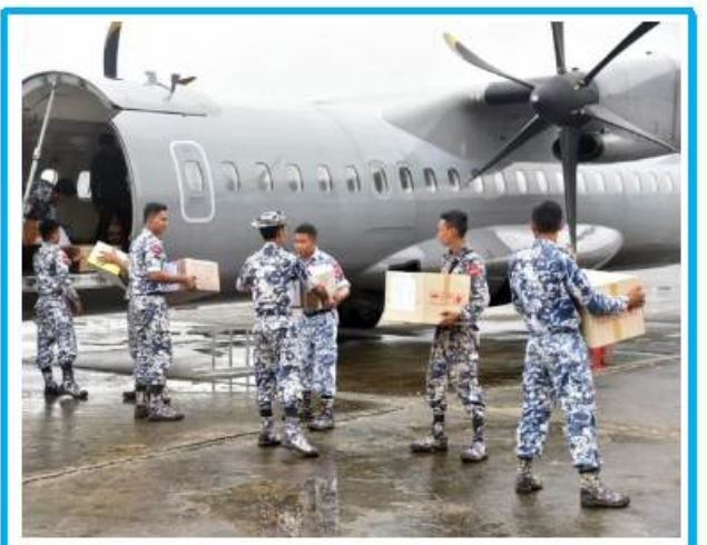
ဆိုင်ကလုန်းမုန်တိုင်း(မိုခါ) တိုက်ခတ်မှုကြောင့် သဘာဝဘေးဒဏ်သင့်ဒေသများရှိ ပြည်သူများအတွက် ထောက်ပံ့ရေးပစ္စည်းများကို တပ်မတော်(လေ)မှ လေယာဉ်၊ ရဟတ်ယာဉ်များဖြင့် ဆက်လက်ပို့ဆောင် စာမျက်နှာ - ၁၆