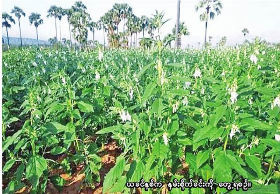
ယခုနှစ်က နှမ်းစိုက်ခင်းကို တွေ့ရစဉ်။

ဝက်လက် ဇူလိုင် ၄ စစ်ကိုင်းတိုင်းဒေသကြီး ရွှေဘိုခရိုင် ဝက်လက်မြို့နယ်တွင် ယခုနှစ် မိုးသီးနှံစိုက်ပျိုးရာသီ၌ နှမ်း ၁၁၉၇၈ ဧကစိုက်ပျိုးပြီးစီးပြီဖြစ်ကြောင်း ဝက်လက်မြို့နယ် စိုက်ပျိုးရေးဦးစီးဌာနမှ သိရသည်။