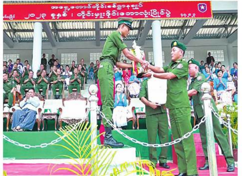
အရှေ့တောင်တိုင်းစစ်ဌာနချုပ် တိုင်းမှူး ဗိုလ်မှူးချုပ်စိုးမင်း ခိုင်းဆုရရှိသည့်အသင်းကို ခိုင်းဆေးအပ်ချီးမြှင့်စဉ်။

နေပြည်တော် ၇ ဇူလိုင် ၄ - အရှေ့တောင်တိုင်းစစ်ဌာနချုပ် ၂၀၂၃ ခုနှစ် တိုင်းမှူးခိုင်းဘောလုံးပြိုင်ပွဲ ဗိုလ်လုပွဲနှင့် ဆုပေးပွဲကို ယနေ့ညနေပိုင်းတွင် တိုင်းစစ်ဌာနချုပ် အားကစားကွင်း၌ပြုလုပ်ရာ တိုင်းမှူး ဗိုလ်မှူးချုပ်စိုးမင်းနှင့် တာဝန်ရှိသူများ၊ အရာရှိ၊ စစ်သည်၊ မိသားစုဝင်များ၊ ပြိုင်ပွဲဝင်အားကစားသမားများ၊ခိုင်းအဖွဲ့ဝင်များ၊ အားကစားနှင့် ကာယပညာသိပ္ပံ(မော်လမြိုင်)မှ ကျောင်းသား၊ ကျောင်းသူများ၊အားကစားဝါသနာရှင်များနှင့်ဖိတ်ကြားထားသူများ တက်ရောက်ကြသည်။ ဦးစွာ တိုင်းမှူးနှင့် တက်ရောက်လာကြ သူများက ပြိုင်ပွဲဝင်အသင်းများ၏ ဗိုလ်လုပွဲယှဉ်ပြိုင်ကစားနေမှုများကို ကြည့်ရှုအားပေးကြသည်။ ထို့နောက် ဆုပေးပွဲကို ဆက်လက်ပြုလုပ်ရာ တစ်ဦးချင်းဆုရရှိသူများ၊ အသင်းလိုက် ဆုရရှိကြသူများနှင့် ခိုင်းဆုရရှိသောအသင်းတို့ကို တိုင်းမှူးနှင့် တာဝန်ရှိသူများက ခိုင်းဆုနှင့် ဂုဏ်ပြုဆုများ အသီးသီးပေးအပ်ချီးမြှင့်ခဲ့ကြကြောင်း သတင်းရရှိသည်။