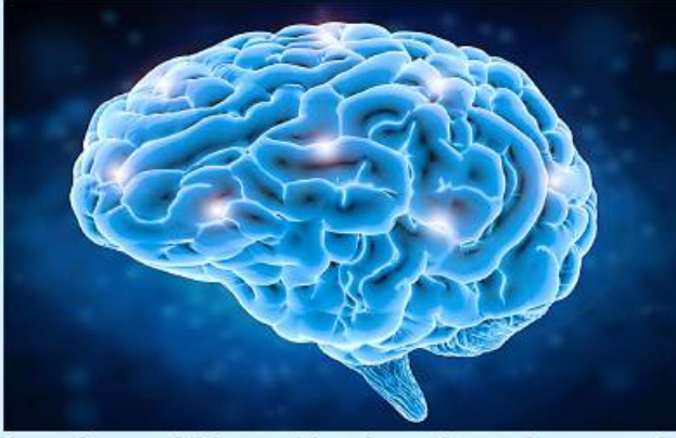
လမ်းလျှောက်ခြင်းဟာ မိမိ တို့ရဲ့ ဦးနှောက်တွေအတွက်

အကျိုးကျေးဇူးများစွာ ပေးစွမ်း ရှိတဲ့ စိတ်ဖိစီးမှုတွေ လျော့ကျ တယ်လို့ သုတေသနတစ်ခုမှာ လေ့လာတွေ့ရှိရပါတယ်။ ဖော်ပြထားပါတယ်။ ဒါ့အပြင် အဲဒီဟော်မုန်းက လမ်းလျှောက်တဲ့ အခါမှာ ဦးနှောက်ရဲ့ အလုံးစုံကျန်းမာရေး အန်ဒေါ့ဖင်လို့ခေါ်တဲ့ ဟော် မုန်းတစ်မျိုးထွက်ရှိမှု မြင့်တက် လာပါတယ်။ အဲဒီဟော်မုန်းက နာကျင်မှုဝေဒနာကို သက်သာ စေတဲ့ ဟော်မုန်းပါ။ အန်ဒေါ့ဖင် ဟော်မုန်းထွက်ရှိလေ မိမိတို့မှာ လျော့ချပေးနိုင်ပါတယ်။