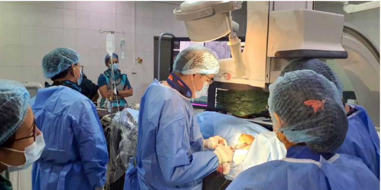
မန္တလေး ရူလိုင် ၄ မြန်မာနိုင်ငံတွင် ပထမဆုံးနည်းပညာ အသစ်အသုံးပြု၍ နှလုံးနှိုးစက်တပ်ဆင်ခြင်း၊ နှလုံးညှစ်အားကောင်းစေသောစက်တပ်ဆင်ခြင်း ကြား နှလုံးနှင့် သွေးကြောရောဂါကုသနာတွင် လူနာငါးဦးကို တပ်ဆင်ကုသပေးသွားမည်ဖြစ်ကြောင်း အဆိုပါဌာနမှ နှလုံးအထူးကုဆရာဝန်ကြီးတစ်ဦးက ပြောပြ၍ သိရသည်။ မန္တလေး အထွေထွေရောဂါကုဆေးရုံကြီး နှလုံးနှင့် သွေးကြောရောဂါကုသနာတွင် နှလုံးအထူးကုဆရာ