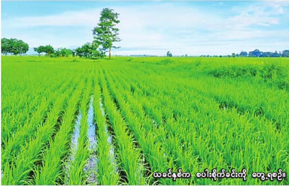
ယခင်နှစ်က စပါးစိုက်ခင်းကို တွေ့ရစဉ်။