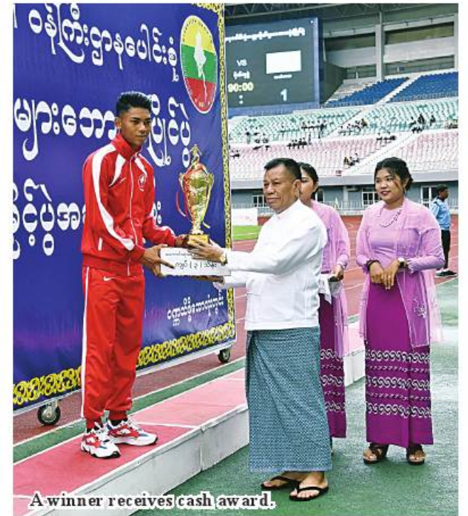
A winner receives cash award.