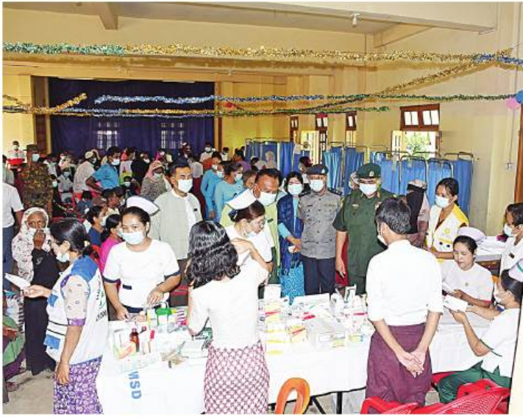
ဗိုလ်မှူးချုပ်တင်ဆွေ နယ်လှည့်ဆေးကုသရေးအဖွဲ့က ဒေသခံပြည်သူများအား ကျန်းမာရေးစောင့်ရှောက်မှုလုပ်ငန်းများ ဆောင်ရွက်ပေးနေမှုကို ကြည့်ရှုအားပေးစဉ်။

နေပြည်တော် ၇ ဇူလိုင် ၄ - နိုင်ငံတော်စီမံအုပ်ချုပ်ရေး ကောင်စီအနေဖြင့် ဆိုင်ကလုန်းမုန်တိုင်း(မိုခါ) တိုက်ခတ်မှုကြောင့် ထိခိုက်ပျက်စီးခဲ့သည့် ဒေသများကို သဘာဝဘေးအန္တရာယ်ဆိုင်ရာ စီမံခန့်ခွဲမှုဥပဒေပုဒ်မ ၁၁ အရ သဘာဝဘေးအန္တရာယ်ကျရောက်သောဒေသများအဖြစ် ကြေညာချက်များထုတ်ပြန်၍ ယင်းကြေညာချက်များပါ ဒေသများတွင် ပြန်လည်ထူထောင်ရေးလုပ်ငန်းများ ဆောင်ရွက်နိုင်ရန် ဒေသအလိုက် တပ်မတော်အရာရှိကြီးများကို ခန့်အပ်တာဝန်ပေးထားပြီးဖြစ်သည်။ ထိုသို့ ပြန်လည်ထူထောင်ရေးလုပ်ငန်းများဆောင်ရွက်ရန်အတွက် ခန့်အပ်တာဝန်ပေးအပ်ထားရှိရာ ယနေ့တွင် ရခိုင်ပြည်နယ် ကျောက်ဖြူမြို့သို့ ရောက်ရှိနေသော ကာကွယ်ရေးဦးစီးချုပ်ရုံး(ကြည်း)မှ ဒုတိယဗိုလ်ချုပ်ကြီးလူအေးသည် ဌာနဆိုင်ရာတာဝန်ရှိသူများနှင့်အတူ ဝုံးချွန်ဘုန်းတော်ကြီးကျောင်းရှိ ဆရာတော်ဘဒ္ဒန္တမောစာရအား ဖူးမြော်ကြည့်ညိ၍ နဝကမ္မအလှူငွေနှင့်စားသောက်ဖွယ်ရာများ ပေးအပ်လှူဒါန်းကာ ဒေသခံပြည်သူများအား ကျန်းမာရေးစောင့်ရှောက်နေမှုများကို သွားရောက်ကြည့်ရှုပြီး ရေသန့်ဘူးများ၊ စားသောက်ကုန်ပစ္စည်းများနှင့် တိုင်းရင်းဆေးမျိုးစုံကို ပေးအပ်လှူဒါန်းကာ အားပေးစကားများပြောကြားသည်။ အလားတူ ရခိုင်ပြည်နယ် ဘူးသီးတောင်မြို့သို့ရောက်ရှိနေသော ကာကွယ်ရေးဦးစီးချုပ်ရုံး(ကြည်း)မှ ဒုတိယဗိုလ်ချုပ်ကြီး