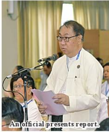
An official presents report.