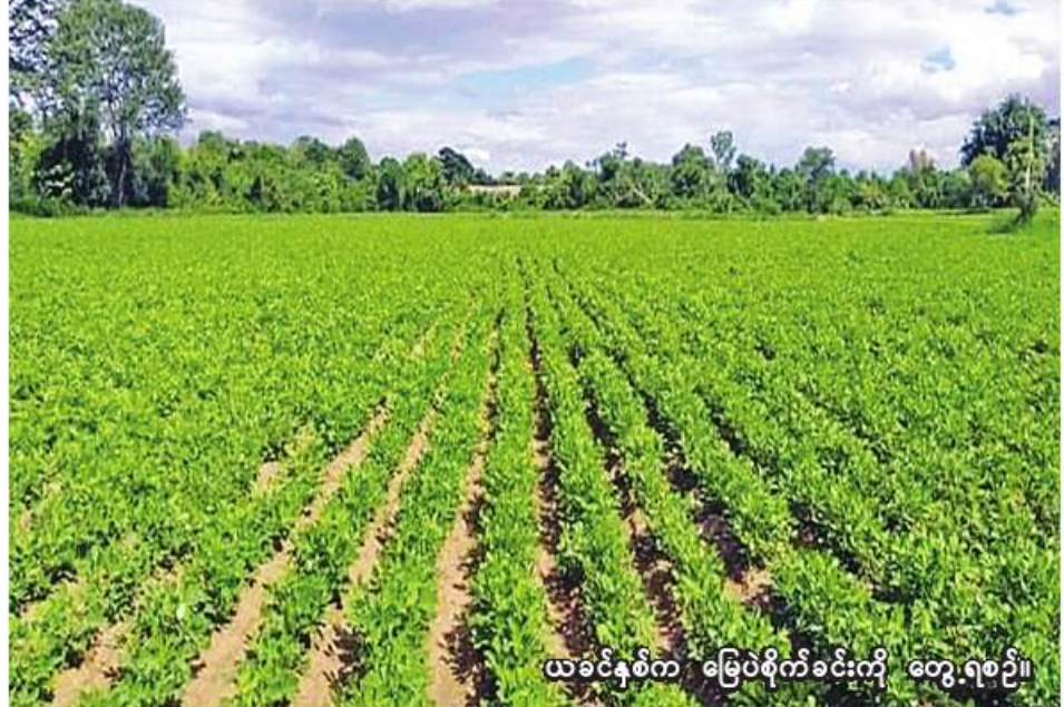
ယခင်နှစ်က မြေပဲစိုက်ခင်းကို တွေ့ရစဉ်။

ထို့ပြင် ရွှေဘိုမြို့နယ် စိုက်ပျိုး ရေးဦးစီးဌာနအနေဖြင့် မြေပဲ တစ်ဧကလျှင် ပန်းတိုင်အထွက်နှုန်း ၇၀ ထွက်ရှိနိုင်ရေးအတွက် မျိုးကောင်းမျိုးသန့်များ အသုံးပြု ခြင်း၊ မြေဩဇာကို အချိန်ကိုက် အသုံးပြုခြင်း စသည့် ဆောင်ရွက် ရမည့်နည်းလမ်းများကို တောင် သူများ စနစ်တကျလိုက်နာဆောင်