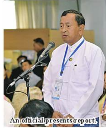
An official presents report.