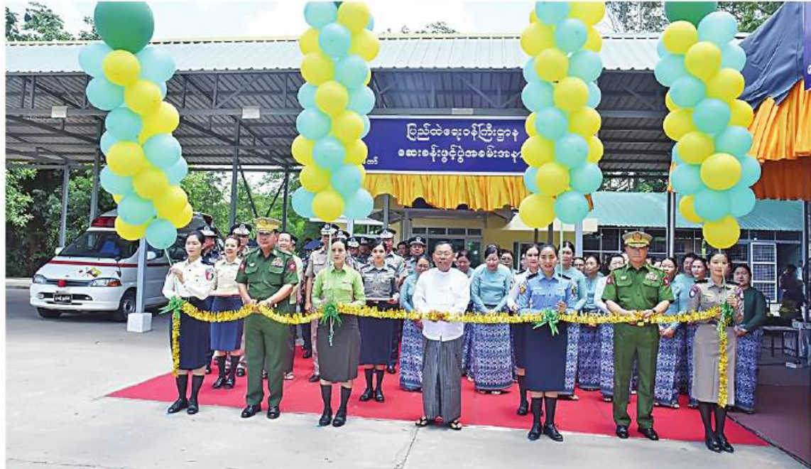
နိုင်ငံတော်စီမံအုပ်ချုပ်ရေးကောင်စီအဖွဲ့ဝင် ဒုတိယဝန်ကြီးချုပ်နှင့် ပြည်ထဲရေးဝန်ကြီးဌာန ပြည်ထောင်စုဝန်ကြီး ဒုတိယဗိုလ်ချုပ်ကြီးစိုးထွန်းနှင့်တာဝန်ရှိသူများက ဆေးခန်းကို ဖဲကြီးဖြတ်ဖွင့်လှစ်ပေးစဉ်

နေပြည်တော် ၇ ဇူလိုင် ။ ပြည်ထဲရေးဝန်ကြီးဌာနရှိ ပြည်ထောင်စုဝန်ကြီးခန်းနှင့်တပ်ဖွဲ့၊ ဦးစီးဌာနများမှ ဝန်ထမ်းများနှင့် ဝန်ထမ်းမိသားစုများ၏ ကျန်းမာရေး အထောက်အပံ့ဖြစ်စေရန် ရည်ရွယ်၍ ပြည်ထဲရေးဝန်ကြီးဌာန ဆေးခန်းဖွင့်ပွဲနှင့် ဆေးပဒေသာပင်အလှူငွေ၊ ဆေးခန်းသုံးပစ္စည်းများပေးအပ် လှူဒါန်းပွဲအခမ်းအနားကို ယနေ့နံနက်ပိုင်း