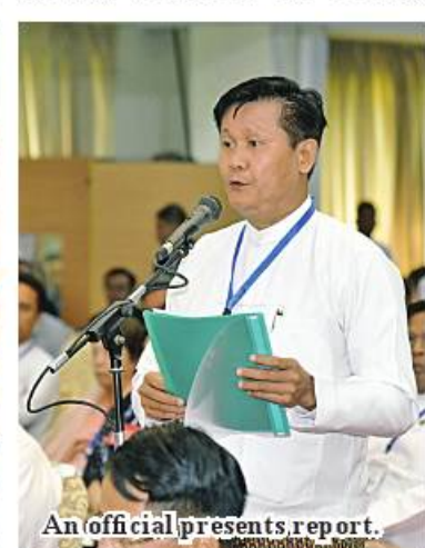
An official presents report.

Due to the weakness in production sector, some regions and states are not as self-sufficient as they should be despite the fact that they have enough land for farming activities. The country