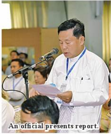
An official presents report.