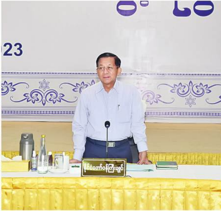
နိုင်ငံတော်စီမံအုပ်ချုပ်ရေးကောင်စီဥက္ကဋ္ဌ နိုင်ငံတော်ဝန်ကြီးချုပ် ဗိုလ်ချုပ်မှူးကြီးမင်းအောင်လှိုင် ပြည်ထောင်စုသမ္မတမြန်မာနိုင်ငံ ကုန်သည်များနှင့် စက်မှုလက်မှုလုပ်ငန်းရှင်များအသင်းချုပ် (UMFCCI) ညီနောင်အသင်းအဖွဲ့များမှ တာဝန်ရှိသူများနှင့်တွေ့ဆုံ၍ နိုင်ငံစီးပွားမြှင့်တင်နိုင်ရေးကိစ္စရပ်များကို ကဏ္ဍအလိုက် ရင်းနှီးပွင့်လင်းစွာဆွေးနွေးပြောကြားစဉ်။

နေပြည်တော် ဇူလိုင် ၂ များအသင်းချုပ် (UMFCCI) ညီနောင်အသင်း နိုင်ငံရေးကိစ္စရပ်များကို ကဏ္ဍအလိုက်ရင်းနှီး ပွင့်လင်းစွာဆွေးနွေးသည်။ နိုင်ငံတော်စီမံအုပ်ချုပ်ရေးကောင်စီ ဥက္ကဋ္ဌ နိုင်ငံတော်ဝန်ကြီးချုပ် ဗိုလ်ချုပ်မှူးကြီး မင်းအောင်လှိုင်သည် ပြည်ထောင်စုသမ္မတမြန်မာ နိုင်ငံကုန်သည်များနှင့် စက်မှုလက်မှုလုပ်ငန်းရှင် မြို့ မင်္ဂလာဒုံမြို့နယ်တွင် နိုင်ငံစီးပွားမြှင့်တင် ရှိ မင်္ဂလာဒုံမြို့နယ်တွင် နိုင်ငံစီးပွားမြှင့်တင် အဖွဲ့များမှ တာဝန်ရှိသူများကို ယနေ့နံနက် ၉ နာရီခွဲတွင် ရန်ကုန်မြို့ ကုန်သည်များနှင့်စက်မှု လက်မှုလုပ်ငန်းရှင်များအသင်းချုပ် (UMFCCI) နှင့် တွေ့ဆုံ၍ နိုင်ငံစီးပွားမြှင့်တင် ရင်းနှီးပွင့်လင်းစွာဆွေးနွေးသည်။ အဆိုပါတွေ့ဆုံပွဲသို့ နိုင်ငံတော်စီမံအုပ်ချုပ်ရေး ကောင်စီဥက္ကဋ္ဌ နိုင်ငံတော်ဝန်ကြီးချုပ်နှင့်အတူ ကောင်စီဝန်ထမ်းအဖွဲ့များ ဖုတ်ယဗိုလ်ချုပ်ကြီး ရဲဝင်းဦး၊ ကောင်စီဝန်ထမ်းဖြစ်ကြသည့် ဒုတိယ ဗိုလ်ချုပ်ကြီးမိုးမြင့်ထွန်း၊ ဒုတိယဝန်ကြီးချုပ်နှင့် စီမံ ကိန်းနှင့် ဘဏ္ဍာရေးဝန်ကြီးဌာန ပြည်ထောင်စု ဝန်ကြီး ဦးဝင်းရှိန်၊ ပြည်ထောင်စုဝန်ကြီးများဖြစ် ကြသည့် စာမျက်နှာ ၁၆ ကော်လံ ၁ ပ။