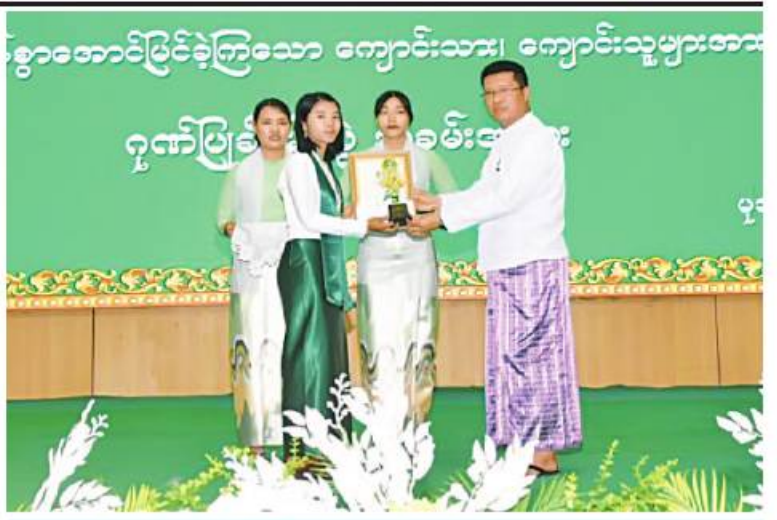
ရာဇဝတ်တိုင်းဒေသကြီးဝန်ကြီးချုပ် ဦးတင်မောင်ဝင်း ၂၀၂၃ ခုနှစ် တက္ကသိုလ်ဝင်စာမေးပွဲတွင် ထူးချွန်စွာ အောင်မြင်ခဲ့ကြသော ကျောင်းသားဦးကို ဂုဏ်ပြုဆုချီးမြှင့်စဉ်။

ဒေသပြည်သူများကို ပြန်လည်ထူထောင်ရေးပစ္စည်းများနှင့် စားသောက်ဖွယ်ရာများကို ဒုတိယအကြိမ်အဖြစ် ထောက်ပံ့ပေးအပ်ကာ အားပေးစကားများ ပြောကြားသည်။ ထို့နောက် ကုလားတန်(၃)ရေယာဉ်ဖြင့် ရောက်ရှိလာသော လေဘေးသင့်ပြည်သူများအတွက် ထောက်ပံ့ပစ္စည်းများကို မီးရထားဆိပ်ရပ်ကွက်ရှိ စားသုံးသူရေးရာဂိုဒေါင်အတွင်း စနစ်တကျထားရှိမှုကို သွားရောက်ကြည့်ရှုစစ်ဆေးပြီး လိုအပ်သည်များ မှာကြားညှိနှိုင်းဆောင်ရွက်ပေးသည်။ အလားတူ မောင်တောမြို့သို့ရောက်ရှိနေသည့် ဗိုလ်မှူးချုပ်တင်ဆွေနှင့် တာဝန်ရှိသူများသည် မောင်တောမြို့ရှိ ကုတင် ၁၀၀ ဆံ့ ခရိုင်ပြည်သူဆေးရုံသို့ သွားရောက်ကာ ဆေးကုသမှုခံယူနေကြသည့် ဒေသပြည်သူများကို အားပေးစကားပြောကြားပြီး အာဟာရပြည့်စွက်စာများ ထောက်ပံ့ပေးအပ်ကာ လိုအပ်သည်များ ညှိနှိုင်းဆောင်ရွက်ပေးခဲ့သည်။ ထို့ပြင် မြို့နယ်အထွေထွေအုပ်ချုပ်ရေးဦးစီးဌာန အစည်းအဝေးခန်းမ၌ ပြုလုပ်သော အခြေခံစာရင်းဇယားရေးဆွဲနည်းနှင့် လုပ်ငန်းစွမ်းဆောင်ရည် မြင့်မားလာစေရန်ရည်ရွယ်၍ စာရေး ဝန်ထမ်းများ အခြေခံစာရင်းဇယားရေးဆွဲနည်းသင်တန်း အမှတ်စဉ်(၁/၂၀၂၃) ဖွင့်ပွဲသို့ တက်ရောက်ခဲ့ကြောင်း သတင်းရရှိသည်။