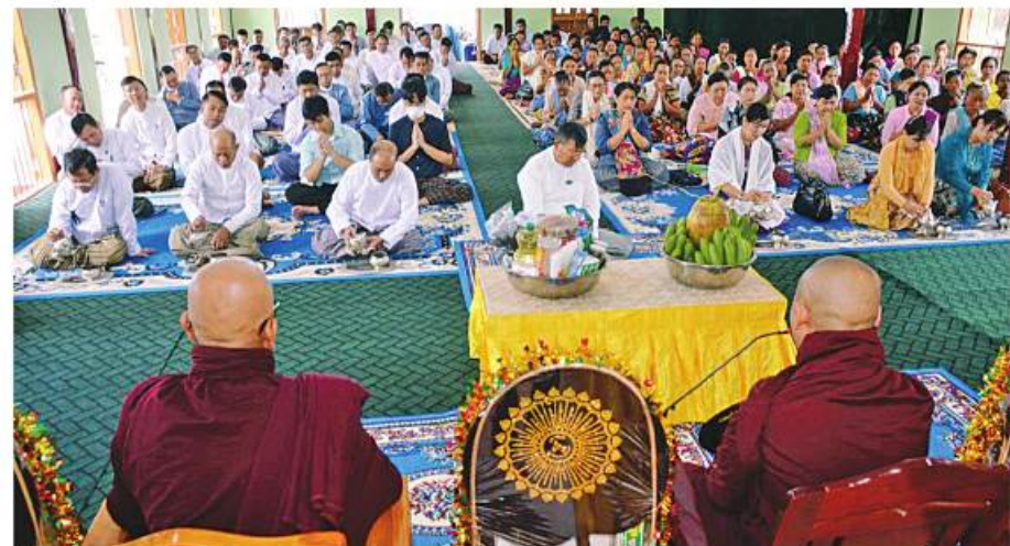
လယ်ဝေးမြို့နယ် အောင်မြင်ကုန်းကျေးရွာ ဘုန်းတော်ကြီးကျောင်း၌ ပြန်လည်ပြုပြင်မွမ်းမံပြီးသော ဓမ္မာရုံ၊ ဆွမ်းစားဆောင်၊ သိမ်ကျောင်းဆောင်နှင့် တစ်ပါးကျောင်းဆောင် နှစ်ဆောင် ရေစက်ချမင်္ဂလာ အခမ်းအနား ကျင်းပစဉ်။

အရာရှိ၊ စစ်သည်မိသားစုများ၊ ဒေသခံပြည်သူများတက်ရောက်ကြည့်ညိုကြသည်။ ဦးစွာ နေပြည်တော်ကောင်စီဥက္ကဋ္ဌ ဦးတင်ဦးလွင် အဖူးပြုသော ဧည့်ပရိသတ်များက လယ်ဝေးမြို့နယ် သံဃနာယကအဖွဲ့ဝင် ဝင်တဲကျောင်းတိုက် ပဓာနနာယက ဆရာတော်ဘဒ္ဒန္တပသန္နစာရဓမ္မာရုံ၊ သံဃာတော်တို့က ချီးမြှင့်တော်မူအပ်သော အန္တရာယ်ကင်းပရိတ်တရားတော်များကို နာယူကြည့်ညိုကြပြီး ဆရာတော်၊ သံဃာတော်များအား လှူဖွယ်ပစ္စည်းများ ဆက်ကပ်လှူဒါန်းကြသည်။ ထို့နောက် နေပြည်တော်ကောင်စီဥက္ကဋ္ဌ ဦးတင်ဦးလွင် အဖူးပြုသော ဧည့်ပရိသတ်များက လယ်ဝေးမြို့နယ် သံဃနာယကအဖွဲ့ဝင် ဝင်တဲကျောင်းတိုက် ပဓာနနာယကဆရာတော် ဘဒ္ဒန္တပသန္နစာရဓမ္မာရုံ၊ အနုမောဒနာတရားနာကြားပြီး အောင်မြင်ကုန်းကျေးရွာ ဘုန်းတော်ကြီးကျောင်း၌ ပြန်လည်ပြုပြင်မွမ်းမံပြီးသော ဓမ္မာရုံ၊ ဆွမ်းစားဆောင်၊ သိမ်ကျောင်းဆောင်နှင့် တစ်ပါး ကျောင်းဆောင်နှစ်ဆောင်တို့ကို လှူဒါန်းမှုအတွက် ရေစက်သွန်းချအမျှ ပေးဝေကြပြီး ဆရာတော်၊ သံဃာတော်များအား နေ့ဆွမ်းဆက်ကပ်လှူဒါန်းခဲ့ကြသည်။ လယ်ဝေးမြို့နယ်အတွင်းရှိ တံတားဦးကျေးရွာနှင့် အောင်မြင်ကုန်းကျေးရွာတို့တွင် ဧပြီ ၂၁ ရက်က လေပြင်းတိုက်ခတ်မှုကြောင့် လူနေအိမ်များ၊ သာသနိက အဆောက်အအုံများ၊ စာသင်ကျောင်းနှင့် ကျန်းမာရေးဌာန အဆောက်အအုံများ