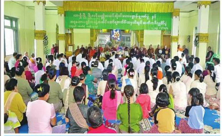
လားရှိုးမြို့ရှိ မြို့မပရိယတ္တိစာသင်တိုက်၌ အသံမမဲမဟာပဋ္ဌာန်းရွတ်ဖတ်ပူဇော်ပွဲ အောင်ပွဲနှင့် အဂ္ဂမဟာပဏ္ဍိတဘွဲ့တံဆိပ်တော်ရ ဆရာတော်အား ဂုဏ်ပြုပူဇော်ပွဲ ကျင်းပပြုလုပ်စဉ်။

သွားရေး၊ ဘုရားဘက္ကားငွေများကို အမှန်တကယ်လိုအပ်သည့်နေရာများတွင် စနစ်တကျသုံးစွဲသွားရေး၊ ယာဉ်ရပ်နားစခန်းအဝင်အထွက်လမ်းများ ကောင်းမွန်ရေး၊ တာဝန်ယူမှုတာဝန်ခံမှုအပြည့်ဖြင့် လုပ်ငန်းများအပေါ်စေတနာထားဆောင်ရွက်သွားရေး၊ အရည်အသွေးကောင်းမွန်ရန်နှင့်သတ်မှတ်ကာလအတွင်းပြီးစီးရေး ကြပ်မတ်ဆောင်ရွက်သွားရန်ပြောကြားပြီး ရှင်းလင်းတင်ပြချက်များအပေါ် သက်ဆိုင်ရာတာဝန်ရှိသူများနှင့် ပေါင်းစပ်ညှိနှိုင်းဆောင်ရွက်ပေးသည်။ ဆက်လက်၍ တိုင်းဒေသကြီးဝန်ကြီးချုပ်နှင့်အဖွဲ့သည် တည်ဆောက်ပြီးစီးသည့် အဆင့်မြင့်သန့်စင်ခန်းနှင့် အဆင့်မြင့် မိုးလုံနေလုံယာဉ်ရပ်နားစခန်း စတင်တည်ဆောက်နေမှုများကို လိုက်လံကြည့်ရှုကာ လိုအပ်သည်များကိုဖြည့်ဆည်း ဆောင်ရွက်ပေးခဲ့ကြောင်း သတင်းရရှိသည်။ မျိုးကျော်