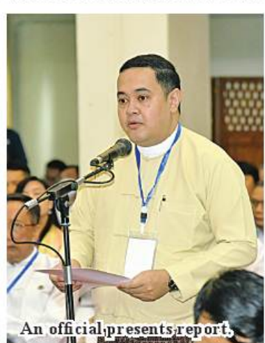
An official presents report.

businesses. Hence, the meeting is to hold talks on requirements and on fulfilling them. The vision of the national task is for national prosperity and food sufficiency. Prosperity means national peace, happiness and tranquility in doing business and pursuing education in all the urban and rural areas of the