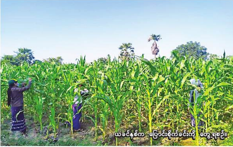
ယခုနှစ်က ပြောင်းစိုက်ခင်းကို တွေ့ရစဉ်။