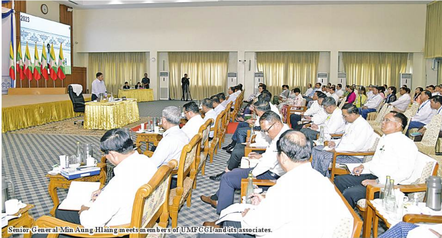
Senior General Min Aung Hlaing meets members of UMFCCI and its associates.