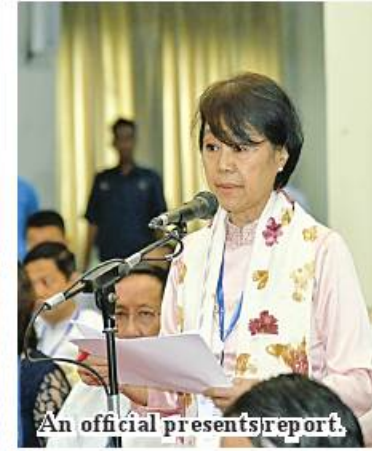
An official presents report.