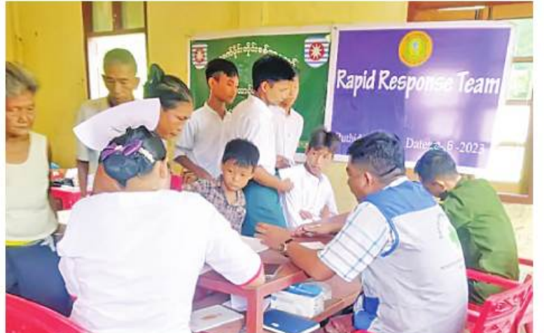
သဘာဝဘေးအန္တရာယ်ကျရောက်သောဒေသများတွင် နယ်လှည့်ဆေးကုသရေးအဖွဲ့များက ဒေသခံပြည်သူများကို ကျန်းမာရေးစောင့်ရှောက်မှုလုပ်ငန်းများ ဆောင်ရွက်ပေးစဉ်။