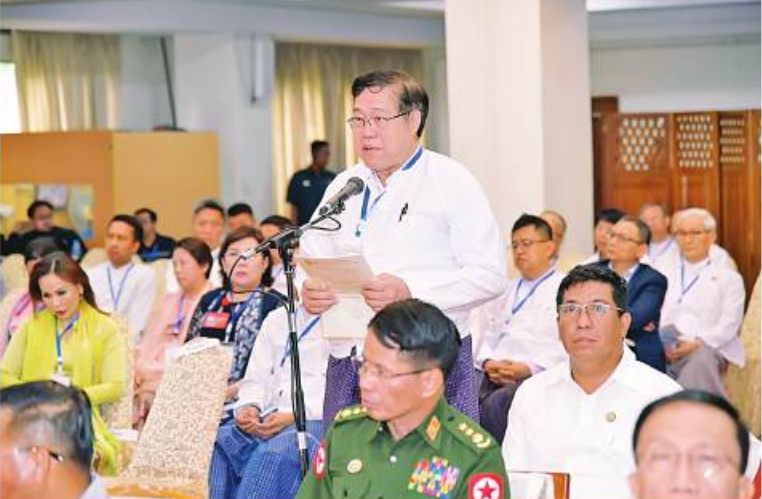
ပြည်ထောင်စုသမ္မတမြန်မာနိုင်ငံ ကုန်သည်များနှင့် စက်မှုလက်မှုလုပ်ငန်းရှင်များအသင်းချုပ်(UMFCCI) ဗဟိုအလုပ်အမှုဆောင်များ၊ ညီနောင်အသင်းအဖွဲ့များမှ တာဝန်ရှိသူများက လုပ်ငန်းဆောင်ရွက်နေမှုအခြေအနေများနှင့် ကဏ္ဍအလိုက် လိုအပ်ချက်များကို တင်ပြဆွေးနွေးစဉ်။

များနှင့် စက်မှုလက်မှုလုပ်ငန်းရှင်များ ရှိခဲ့ခြင်းမရှိကြောင်း၊ ဒီမိုကရေစီအစိုးရ အသင်းချုပ် (UMFCCI)သည် အဓိက အားဖြင့် ရောင်းဝယ်မှုများဆောင်ရွက်သည့် အဖွဲ့ဖြစ်ကြောင်း၊ ထုတ်ကုန်ပစ္စည်းများ ရရှိခဲ့ကြောင်း၊ အဆိုပါငွေများဖြင့် နိုင်ငံခြား ရှိမှသာလျှင် ရောင်းဝယ်မှုများ ဆောင်ရွက် နိုင်မည်ဖြစ်ကြောင်း၊ ထိုသို့ရောင်းချရာတွင် အရေအတွက်များများ ရောင်းချနိုင်ရေး