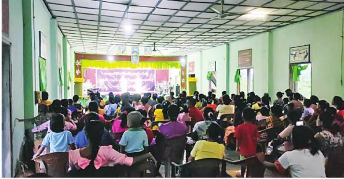
ရခိုင်ပြည်နယ်အတွင်း မိုခါမုန်တိုင်းသင့်ဒေသများတွင် ပြန်လည်ထူထောင်ရေးလုပ်ငန်းများ ဆောင်ရွက်လျက်ရှိသည့် နယ်မြေခံ တပ်မတော်သားများ၊ မြန်မာနိုင်ငံရဲတပ်ဖွဲ့ ဝင်များ၊ မီးသတ်တပ်ဖွဲ့ ဝင်များနှင့် မိသားစုဝင်များကို နယ်လှည့်ပြည်သူ့ဆက်ဆံရေး တပ်ခွဲမှ စစ်သမားများက ကပြသီဆိုဖျော်ဖြေစဉ်။

နေပြည်တော် ၇ ဇူလိုင် ၂ ရခိုင်ပြည်နယ်အတွင်းရှိ မိုခါမုန်တိုင်း ဒဏ်သင့်ဒေသများတွင် ပြန်လည် ထူထောင်ရေးလုပ်ငန်းများ ဆောင်ရွက် လျက်ရှိသည့် နယ်မြေခံတပ်မတော်သား များ၊ မြန်မာနိုင်ငံရဲတပ်ဖွဲ့ဝင်များ၊ မီးသတ် တပ်ဖွဲ့ဝင်များနှင့် မိသားစုဝင်များကို စိတ်ချမ်းသာစေရန်နှင့် ပင်ပန်း နှမ်းနယ်မှုများ ပြေပျောက်စေရန်အတွက် ယနေ့ညနေပိုင်းတွင် ဝါခတ်ချောင်း တပ်နယ်ရှိ နယ်မြေခံတပ်ရင်းခန်းမ၌ ကာကွယ်ရေးဦးစီးချုပ်ရုံး(ကြည်း) ပြည်သူ့ ဆက်ဆံရေးနှင့် စိတ်ဓာတ်စစ်ဆင်ရေး ညွှန်ကြားရေးမှူးရုံး တွင်ကမ္ဘာအောက်ရှိ နယ်လှည့်ပြည်သူ့ဆက်ဆံရေးတပ်ခွဲမှ စစ် သည်၊ စစ်သမားများက အဆိုအကများဖြင့် ဖျော်ဖြေတင်ဆက်ကြသည်။ ထိုသို့ ဖျော်ဖြေတင်ဆက်ရာတွင် စစ်သည်၊ စစ်သမားများက မြန်မာသံစဉ် တေးသီချင်းများ၊ ခေတ်ပေါ်တေးသီချင်း အဆိုအကများ၊ တေးသရုပ်ဖော်အကများ၊ ရယ်ရွှင်ဖွယ်ရာဟာသပြဇာတ်၊ ဒေသ၏ ရိုးရာယဉ်ကျေးမှုအကအလှများ၊ ဗဟုသုတ ဖြစ်ဖွယ်ရာ အသိပညာပေးအစီအစဉ် များဖြင့် ကဏ္ဍစုံလင်စွာ သီဆိုကပြ ဖျော်ဖြေကြရာ နယ်မြေခံတပ်နယ်မှ တပ်မတော်အရာရှိကြီးများ၊ စစ်သည်၊ မိသားစုဝင်များ၊ ဌာနဆိုင်ရာဝန်ထမ်းများ၊ မြန်မာနိုင်ငံရဲတပ်ဖွဲ့ဝင်များ၊ မီးသတ်တပ်ဖွဲ့ ဝင်များနှင့် မိသားစုဝင်များ ပျော်ရွှင်စွာ ကြည့်ရှုအားပေးကြသည်။ ထိုသို့ သီဆို ကပြဖျော်ဖြေသော စစ်သည်၊ စစ်သမား များကို နယ်မြေခံတပ်နယ်မှ တာဝန်ရှိသူ တို့က ဆုငွေများ အသီးသီးပေးအပ် ချီးမြှင့်ခဲ့ကြောင်း သတင်းရရှိသည်။