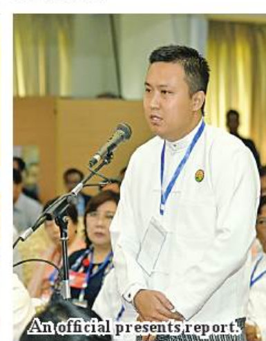
An official presents report.

will surely enjoy food sufficiency. Success in farming activities will boost production, and based on the output of raw materials, stocks for local consumption and exports will increase, followed by the development of farming sector, industrial sector and services sector.