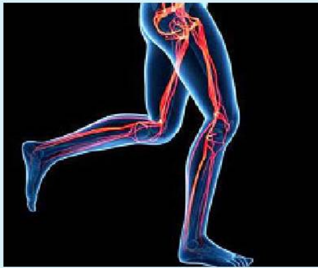
မိမိတို့ရဲ့ ခန္ဓာကိုယ်မှာ ပေါ်လွင်လာပြီး သန်မာလာမှာ အဆီပိုတွေ မရှိတော့ဘူးဆိုရင် ကြွက်သားတွေကလည်း ပိုမို ခိုင်ခံ့ ဖြစ်နိုင်တယ်ဆိုရင်

တော့ တစ်ရက်ကို ခြေလှမ်းရေ ထိရောက်မှုရှိလှပါတယ်။ ၁၀၀၀၀ လောက် လမ်းလျှောက် ပေးရုံနဲ့တင် ရရှိနိုင်ပါတယ်။ ဒီထက်ပိုပြီး ပြင်းထန်တဲ့ လေ့ကျင့်ခန်းမျိုးလိုချင်တယ်ဆို ရင်တော့ တောင်တက်လမ်း လျှောက်ခြင်းကိုလည်း ကြိုးစား ကြည့်သင့်ပါတယ်။ ဒါ့အပြင် စတုရန်း ၃၀ မှ ၁ မီနစ် ၂ မိနစ်အထိ ခပ်မြန်မြန်လမ်း လျှောက်ပြီး ပုံမှန်လမ်းပြန် လျှောက်ခြင်း၊ အဲဒီနောက် ခပ် မြန်မြန်ပြန်ပြီး လမ်းလျှောက်ခြင်း လိုမျိုး လေ့ကျင့်ခန်းတွေကလည်း ထိရောက်မှုရှိလှပါတယ်။ လမ်းလျှောက်ခြင်းဟာ သင့် ခန္ဓာကိုယ်တစ်လျှောက်မှာရှိတဲ့ ကြွက်သားတွေရဲ့ တင်းအားကို တိုးမြှင့်စေတာသာဖြစ်ပါတယ်။ လမ်းလျှောက်ခြင်းဟာ ပြင်း ထန်တဲ့ လေ့ကျင့်ခန်းမဟုတ်တဲ့ အတွက် ကြွက်သားတွေနာကျင် ခြင်းမရှိစေပါဘူး။ ဒါ့ကြောင့် အနာတရဖြစ်တာမျိုး၊ နောက် တစ်ခေါက် လမ်းလျှောက်ဖို့ အတွက် ကြွက်သားတွေနာလို့ မလျှောက်နိုင်တာမျိုးလည်း မဖြစ် စေပါဘူး။