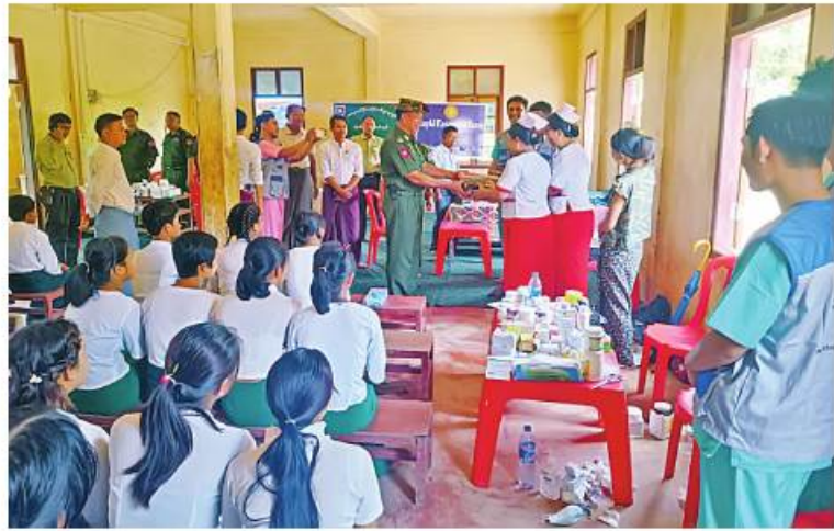
ကာကွယ်ရေးဦးစီးချုပ်ရုံး(ကြည်း)မှ ဒုတိယဗိုလ်ချုပ်ကြီးအေးဝင်း ဘူးသီးတောင်မြို့ ရွာမကျေးရွာ နယ်စပ်ဒေသ ဂန္ဓရီလူငယ်ဖွံ့ဖြိုးရေး ပရဟိတကျောင်းရှိ ကျောင်းသား၊ ကျောင်းသူများကို အားပေးစကားပြောကြားပြီး စားသောက်ဖွယ်ရာများပေးအပ်စဉ်။

နေပြည်တော် ၇ ဇူလိုင် ၂ နိုင်ငံတော်စီမံအုပ်ချုပ်ရေး ကောင်စီ အနေဖြင့် ဆိုင်ကလုန်းမုန်တိုင်း(မိုခါ) တိုက်ခတ်မှုကြောင့် ထိခိုက်ပျက်စီးခဲ့သည့် ဒေသများကို သဘာဝဘေးအန္တရာယ် ဆိုင်ရာ စီမံခန့်ခွဲမှုဥပဒေ ပုဒ်မ ၁၁ အရ သဘာဝဘေးအန္တရာယ် ကျရောက်သော ဒေသများအဖြစ် ကြေညာချက်များထုတ်ပြန်၍ ယင်းကြေညာချက်များပါ ဒေသများတွင် ပြန်လည်ထူထောင်ရေးလုပ်ငန်းများ ဆောင်ရွက်နိုင်ရန် ဒေသအလိုက် တပ်မတော်အရာရှိကြီးများကို ခန့်အပ်တာဝန်ပေးထားပြီးဖြစ်သည်။