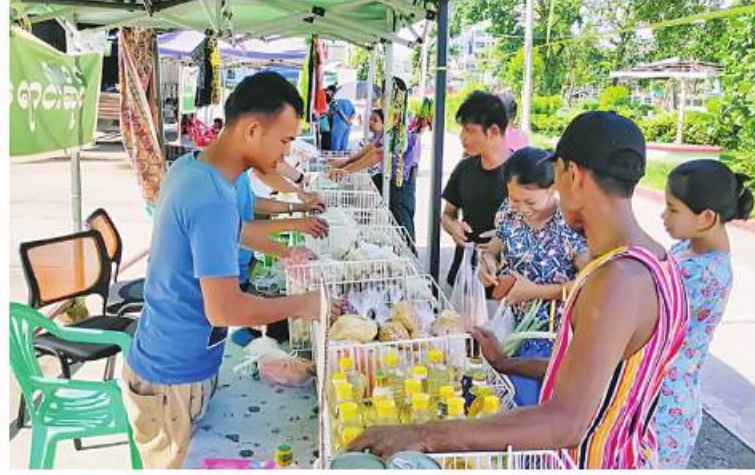
မုန်တိုင်းဒဏ်သင့်ပြည်သူများကို ဆန်၊ ဆီ၊ ဆား၊ ကြက်ဥ၊ ဟင်းသီးဟင်းရွက်များ၊ စားသောက်ကုန်ပစ္စည်းများနှင့် လူသုံးကုန်ပစ္စည်းများကို ဈေးနှုန်းသက်သာစွာဖြင့်ရောင်းချပေးစဉ်။

နေပြည်တော် ၇ ဇူလိုင် ၂ ဆိုင်ကလုန်းမုန်တိုင်း(မိုခါ) တိုက်ခတ်မှုကြောင့် ပျက်စီးမှုများဖြစ်ပေါ်ခဲ့သည့် စစ်တွေမြို့ရှိ မုန်တိုင်းဒဏ်သင့် ဒေသပြည်သူများနှင့် ဌာနဆိုင်ရာဝန်ထမ်းများ၏ စားသောက်ရေးအဆင်ပြေစေရန်နှင့် မိမိတို့အလိုရှိရာ စားသောက်ကုန်ပစ္စည်းများကို ဈေးနှုန်းသက်သာစွာဖြင့် ဝယ်ယူစားသောက်နိုင်ရေးအတွက် အနောက်ပိုင်းတိုင်းစစ်ဌာနချုပ် နယ်မြေခံတပ်မတော်သားများနှင့် တာဝန်ရှိသူများက နေ့စဉ် ရောင်းချပေးလျက်ရှိသည်။ ယနေ့တွင်လည်း စစ်တွေမြို့ ဦးဥတ္တမပန်းခြံ၌ ဆန်၊ ဆီ၊ ဆား၊ အသား၊ ငါးကြက်ဥ၊ ဘဲဥ၊ နို့ထွက်ပစ္စည်းများ၊ ဟင်းသီးဟင်းရွက်များ၊ ကြက်သွန်နီ၊ ကြက်သွန်ဖြူနှင့် တပ်မတော်စက်ရုံများနှင့် မြန်မာစီးပွားရေးကော်ပိုရေးရှင်းတို့မှ ထုတ်လုပ်သည့် ခေါက်ဆွဲခြောက်၊ ဘီစကွတ်နှင့် စည်သွတ်ဘူးများဖြစ်သည့် အမဲသားဘူး၊ မျှစ်စားတော်ပဲဘူး၊ ကြက်သားအာလူးဘူး၊ ငါးတန်အချိုပေါင်းဘူး၊ ငါးသလောက်ဘူး၊ ငါးပိကြော်ဘူး၊ ပဲထောပတ်ဘူး၊ ပဲခရမ်းဘူး၊ သရက်သီးသနပ်ဘူးစသည့် စားသောက်ကုန်များ၊ မြန်မာ့စီးပွားရေးဦးပိုင် အများ