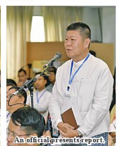
An official presents report.

MSMEs are involved in industries. MSMEs will be operated to produce goods with raw materials available at home. Agriculture and livestock products which are sure raw materials of the country are being manufactured. Rice mills and oil mills are inclusive of industries. As Myanmar yields beans and pulses and oil crops, oil mills can be operated. If oil can be produced from groundnut, sesame, niger, sunflower, horse gram and oil crops at current production rate, the country will have 126.2 per cent of oil sufficiency. In using oil crops, people consume groundnut and sesame traditionally, export them and produce oil. Traditional consumption and export can reduce a half of production of groundnut and sesame volume, lessening the local oil sufficiency. Hence, if export of oil crops and traditional consumption can be restricted rather than production of oil, it will meet the local oil demand.