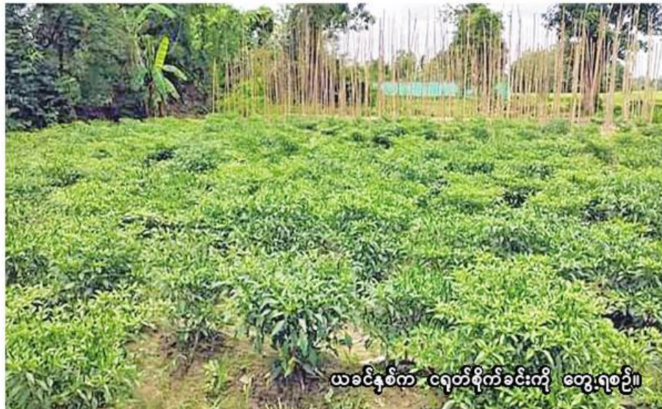
ယခင်နှစ်က ငရုတ်စိုက်ခင်းကို တွေ့ရစဉ်။