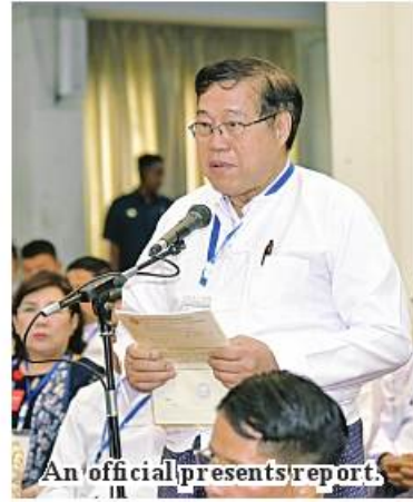
An official presents report.