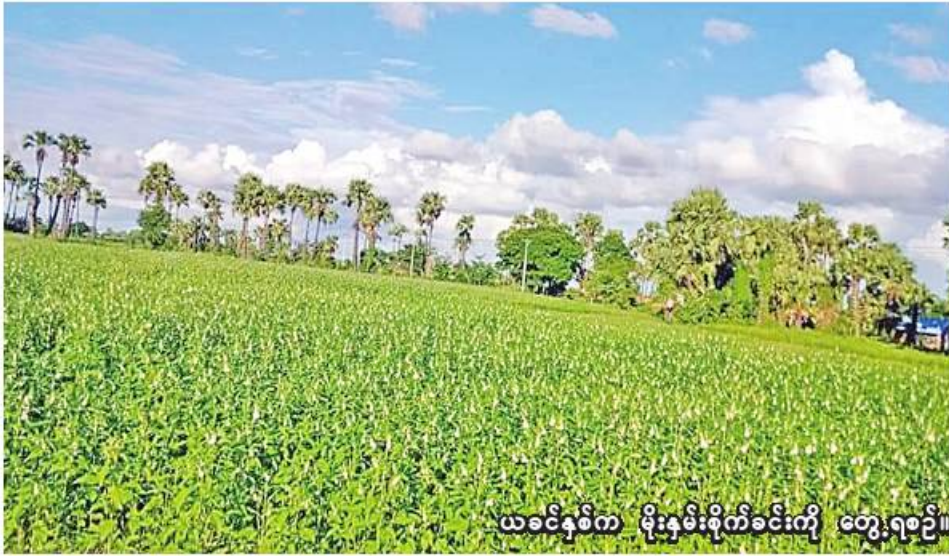
ယခင်နှစ်က မိုးနှမ်းစိုက်ခင်းကို တွေ့ရစဉ်။

မုံရွာ ဇူလိုင် ၂ စစ်ကိုင်းတိုင်းဒေသကြီး မုံရွာခရိုင်တွင် ယခုနှစ် မိုးသီးနှံစိုက်ပျိုးရာသီ၌ မိုးနှမ်း ၈၈၀၁ ကေ စိုက်ပျိုးပြီးစီးပြီဖြစ်ကြောင်း မုံရွာခရိုင်စိုက်ပျိုးရေးဦးစီးဌာနမှ သိရသည်။ မုံရွာခရိုင်တွင် ယခုနှစ် မိုးသီးနှံစိုက်ပျိုးရာသီ၌ မိုးနှမ်း ၁၀၉၈၇၂ ကေ စိုက်ပျိုးရန် လျာထားပြီး ယခုနှစ် မေလက စတင်စိုက်ပျိုးခဲ့ရာ ယနေ့ထိ မိုးနှမ်း ၈၈၀၁ ကေစိုက်