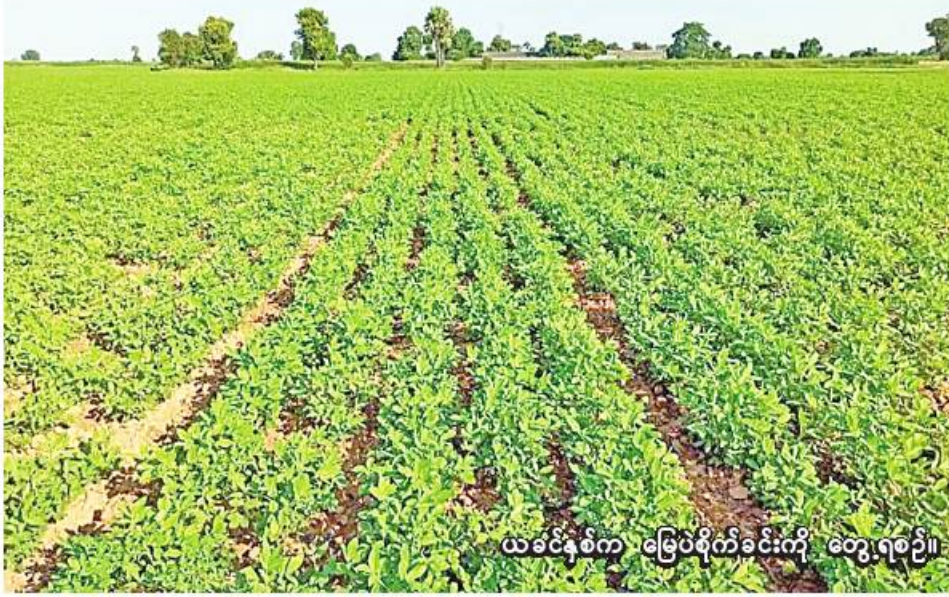
ယခုနှစ်က မြေပဲစိုက်ခင်းကို တွေ့ရစဉ်။