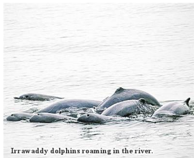
Irrawaddy dolphins roaming in the river.

Shwegu Township and 14 in Bhamo Township, totalling 79 from 10 to 20 February 2023. 184