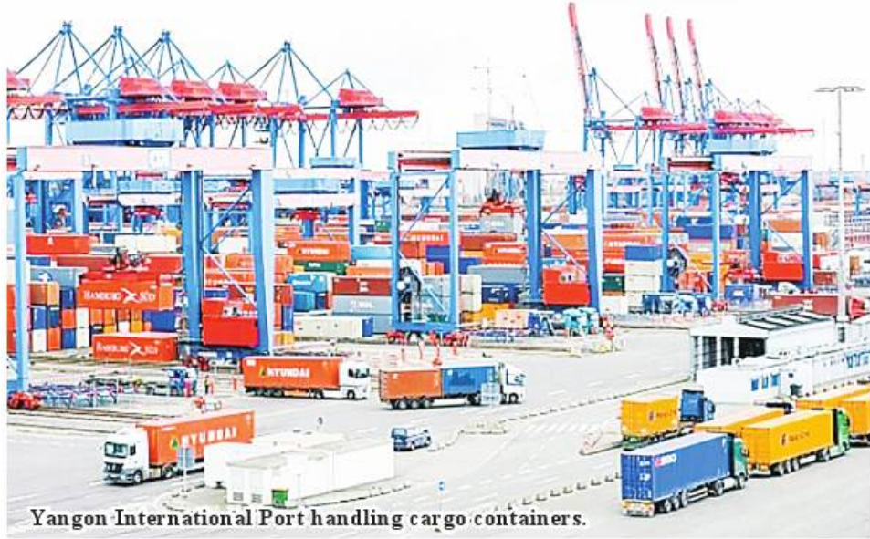
Yangon International Port handling cargo containers.