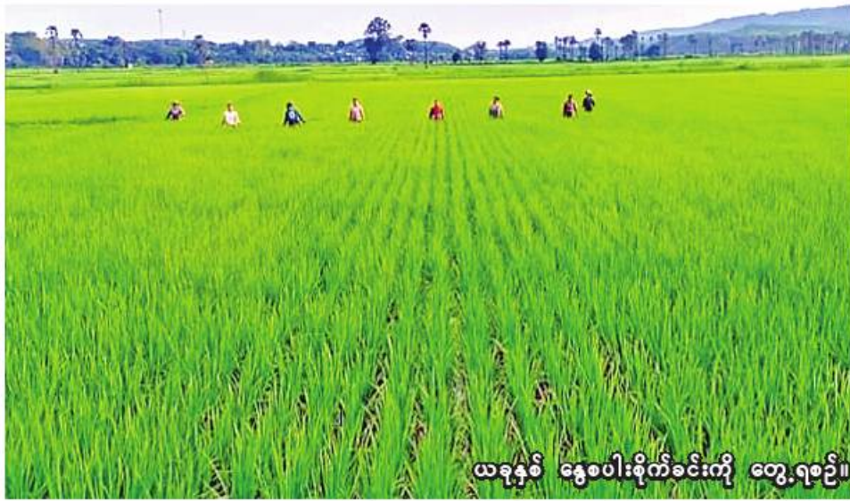
ယခုနှစ် နွေစပါးစိုက်ခင်းကို တွေ့ရစဉ်။