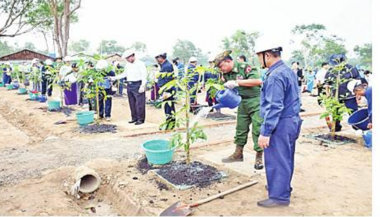
ရန်ကုန်တိုင်းဒေသကြီး ဝန်ကြီးချုပ် ဦးစိုးသိန်းနှင့် တိုင်းမှူး ဗိုလ်ချုပ်လှိုင်ဟိန်း တို့က မဟော်ဂနီပင်ကို ဦးဆောင်စိုက်ပျိုးကြစဉ်။

နေပြည်တော် ဇူလိုင် ၁ ရန်ကုန်တိုင်းဒေသကြီး အမျိုးသမီး တိုင်းမှူးနှင့် တာဝန်ရှိသူများက အမျိုးသမီး ရေးရာကော်မတီကကြီးမှူး၍ ၂၀၂၃ ခုနှစ် မြန်မာအမျိုးသမီးများနေ့ အထိမ်း အမှတ် မိုးရာသီ သစ်ပင်စုပေါင်းစိုက်ပျိုးပွဲကို ယနေ့နံနက်ပိုင်းတွင် မင်္ဂလာဒုံမြို့နယ်ရှိ လှော်ကား ရေဝေရေလဲဒေသ၌ ပြုလုပ်ရာ တိုင်းဒေသကြီးဝန်ကြီးချုပ် ဦးစိုးသိန်း၊ ရန်ကုန်တိုင်းစစ်ဌာနချုပ် တိုင်းမှူး ဗိုလ်ချုပ်လှိုင်ဟိန်းနှင့် တာဝန် ရှိသူများ၊ ခရိုင်၊ မြို့နယ် အမျိုးသမီးရေးရာ ကော်မတီဝင်များ၊ မိခင်နှင့်ကလေး စောင့်ရှောက်ရေးအဖွဲ့များ၊ ရန်ကုန် မြို့တော် စည်ပင်သာယာရေးကော်မတီ ပန်းဥယျာဉ်နှင့် အားကစားတွင်းများ ဌာနတို့မှ ဝန်ထမ်းများ တက်ရောက် ကြသည်။ ဦးစွာ တိုင်းဒေသကြီးဝန်ကြီးချုပ်၊ တိုင်းမှူးနှင့် တာဝန်ရှိသူများက အမျိုးသမီး ရေးရာကော်မတီဝင်များသို့ စိုက်ပျိုးမည့် ပျိုးပင်များ အသီးသီးပေးအပ်ကြသည်။ ထို့နောက် တိုင်းဒေသကြီးဝန်ကြီးချုပ်နှင့် တိုင်းမှူးတို့က ရတနာတန်းဝင်ပင်ဖြစ်သည့် မဟော်ဂနီပင်ကို ဦးဆောင်စိုက်ပျိုးပြီး တက်ရောက်လာကြသူများ၏ ပျိုးပင်များ စိုက်ပျိုးနေမှုကို လိုက်လံကြည့်ရှု အားပေးသည်။ ယနေ့ပြုလုပ်သည့် ရန်ကုန်တိုင်း ဒေသကြီး အမျိုးသမီးရေးရာကော်မတီက ကြီးမှူးကျင်းပသော ၂၀၂၃ ခုနှစ် မြန်မာ အမျိုးသမီးများနေ့ အထိမ်းအမှတ် မိုးရာသီသစ်ပင်စိုက်ပျိုးပွဲ၌ ရတနာ တန်းဝင် ပင် ၆၄၈၀ တို့ကို စုပေါင်းစိုက်ပျိုး ခဲ့ကြောင်း သတင်းရရှိသည်။