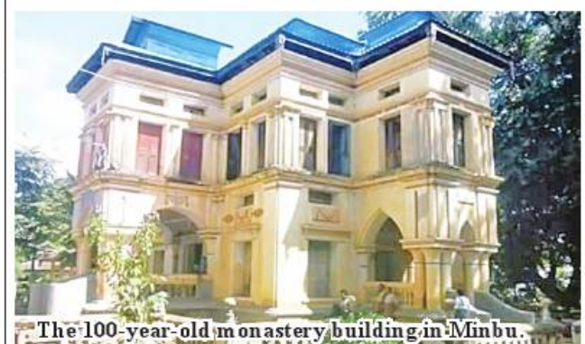
The 100-year-old monastery building in Minbu.