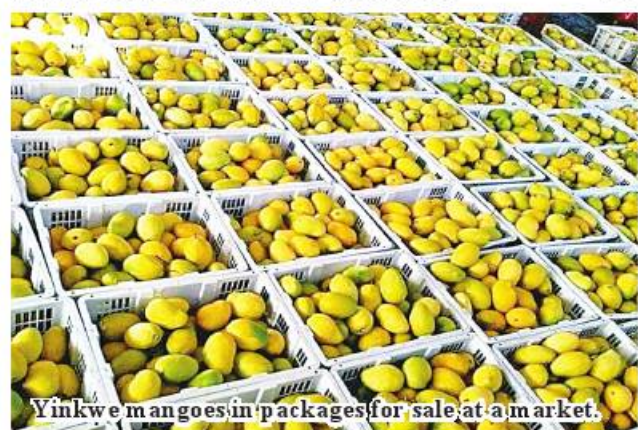
Yinkwe mangoes in packages for sale at a market.

Methi mangoes to the Chinese market in the mango season. This year's yield is