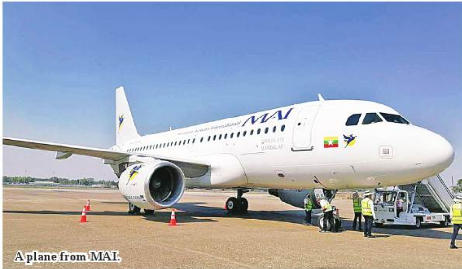
A plane from MAI.

Yangon July 1 Myanmar Airways International (MAI) will arrange more direct flights to Thailand's Don Mueang Airport from Yangon and Mandalay starting from July 14, according to the news released by the airline on June 28.