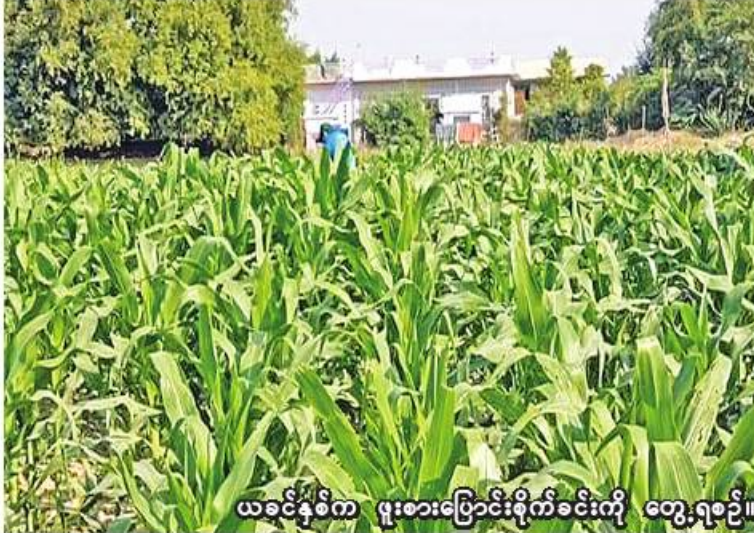
ယခင်နှစ်က ဖူးစားပြောင်းစိုက်ခင်းကို တွေ့ရစဉ်။ တွင်းသရုပ်ပြပွဲများ ဆောင်ရွက်ပေးခြင်း၊ ကာကွယ်ရေးနည်းလမ်းများကို တွင်းဆင်း ဆွေးနွေးပွဲများ ဆောင်ရွက်ပေးခြင်း၊ စိုက်ဆောင်ရွက်ပေးလျက်ရှိကြောင်း စစ်ကိုင်း မြို့နယ် စိုက်ပျိုးရေးဦးစီးဌာန မြို့နယ် ဦးစီးမှူး ဦးလော်ဦးက ပြောပြ၍ သိရသည်။ (၂၀၆)

ဟင်းရွက် ၆၁၂၃ ဧက၊ သစ်သီးပင်ဧက ၂၈၉၀၊ နဂါးမောက် လေးဧက၊ ကျွဲ၊ နွားစာ ၂၅၉၅၃ ဧက၊ အခြားသီးနှံ ၂၄၀၁ ဧက၊ နာနတ်လျော် ၁၄ ဧက၊ ချဉ်ပေါင် လျော် ၃၃ ဧက စုစုပေါင်း ၄၀၉၃၃ ဧက တို့ဖြစ်ကြောင်း သိရသည်။ ယခင်နှစ် မိုးသီးနှံစိုက်ပျိုးရာသီက စစ်ကိုင်းမြို့နယ်တွင် သီးနှံစုံ ၁၁၀၆၂၂ ဧက စိုက်ပျိုးနိုင်ခဲ့ကြောင်း စစ်ကိုင်းမြို့နယ် စိုက်ပျိုးရေးဦးစီးဌာန စာရင်းများအရ သိရသည်။ ယခုနှစ် စစ်ကိုင်းမြို့နယ်တွင် မိုးသီးနှံ စိုက်ပျိုးမည့်တောင်သူများကို မြို့နယ် စိုက်ပျိုးရေးဦးစီးဌာနက သင်တန်းပေးခြင်း၊