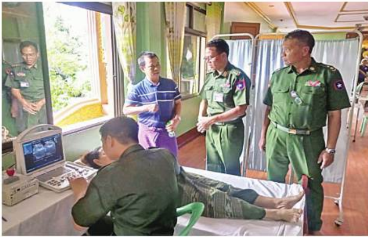
အလယ်ပိုင်းတိုင်းစစ်ဌာနချုပ် နယ်မြေခံဆေးကုသရေးအဖွဲ့က ဒေသခံပြည်သူတစ်ဦးအား ကျန်းမာရေးစောင့်ရှောက်မှုလုပ်ငန်းများ ဆောင်ရွက်ပေးနေမှုကို တာဝန်ရှိသူများက ကြည့်ရှုအားပေးစဉ်။

နေပြည်တော် ၇ ဇူလိုင် ၁ မန္တလေးတိုင်းဒေသကြီး အောင်မြင်သာယာမြို့နယ် ပြည်ကြီးရန်လုံခြုံရေးကွက်ရှိ သံဃာတော်များ၊ သာသနာ့ဌာနဝင် သီလရှင်များနှင့် ဒေသခံပြည်သူများကို ယနေ့နံနက်ပိုင်းတွင် အလယ်ပိုင်းတိုင်း စစ်ဌာနချုပ် နယ်မြေခံဆေးကုသရေးအဖွဲ့က အဆိုပါရန်ကွက်ရှိ မဟာစိတြာရာမ ကျောင်းတိုက်၌ ကျန်းမာရေးစောင့်ရှောက်မှု လုပ်ငန်းများ ဆောင်ရွက်ပေးသည်။ ထိုသို့ ဆောင်ရွက်ပေးရာတွင် ဆေးကုသရေးအဖွဲ့က သံဃာတော် အပါး ၂၀ နှင့် ဒေသခံပြည်သူဦးရေ ၁၀၀ တို့ကိုသွေးတိုး ရောဂါ၊ အဆစ်အမျက်ရောင်ရောဂါ၊ ဆီးချို ရောဂါ၊ အသက်ရှူလမ်းကြောင်းဆိုင်ရာ ရောဂါ၊ မျက်စိရောဂါ၊ သွားနှင့်ခံတွင်း ရောဂါ၊ ခွဲစိတ်ကုသမှုဆိုင်ရာရောဂါ၊ သားဖွားမီးယပ်ရောဂါ၊ ကလေးရောဂါ၊ အထွေထွေရောဂါတို့နှင့် ပတ်သက်၍ လိုအပ်သည် ကျန်းမာရေးစစ်ဆေးကုသ ပေးခြင်းများ ဆောင်ရွက်ပေးသည်။ ဆက်လက်၍ ကိုဗစ်- ၁၉ ရောဂါ တာကွယ် ဆေးထိုးနှံရန်လိုအပ်သည် သံဃာတော် ၁၂၆ ပါးနှင့် ဒေသခံပြည်သူ ၅၂ ဦး တို့ကို ဆေးကုသရေးအဖွဲ့နှင့် မြို့နယ်ပြည်သူ ကျန်းမာရေးဝန်ထမ်းများက တာကွယ် ဆေးထိုးနှံပေးခြင်းများ ဆောင်ရွက်ခဲ့သည်။