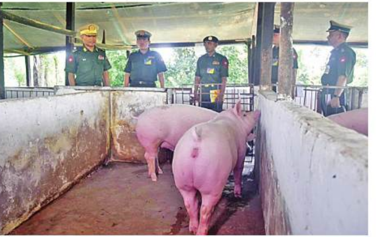
တောင်ပိုင်းတိုင်းစစ်ဌာနချုပ် တိုင်းမှူး ဗိုလ်ချုပ်ထိန်ဝင်း နယ်မြေတပ်ရင်း၌ ဝက်များမွေးမြူထားရှိမှုကို ကြည့်ရှုစစ်ဆေးစဉ်။

နေပြည်တော် ဇူလိုင် ၁ ကိုဗစ်-၁၉ ရောဂါ ဖြစ်ပွားမှုကြောင့် ရောဂါကာကွယ် ထိန်းချုပ်၊ ကုသရေး လုပ်ငန်းများ ဆောင်ရွက်နေချိန်တွင် ဒေသတွင်း စားရေရိက္ခာဖူလုံရေးနှင့် ပြည်သူများ၏ စားသောက်ရေးကို အထောက်အကူ ဖြစ်စေရန်အတွက် တိုင်းစစ်ဌာနချုပ်များ၊ တပ်ရင်း၊ တပ်ဖွဲ့ များ၌ စိုက်ပျိုး၊ မွေးမြူရေးလုပ်ငန်းများကို ဆောင်ရွက်လျက်ရှိသည်။ ထိုသို့ဆောင်ရွက်လျက်ရှိရာ ဇွန် ၃၀