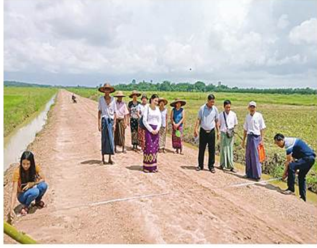
ရူလိုင်ကို

အရှည် ငါးပေ၊ အကျယ် ၁၅ ပေနှင့် အမြင့် ငါးပေရှိ Box Culvert သုံးစင်း တည်ဆောက်ခြင်းလုပ်ငန်းများကို တင်ဒါအောင်မြင်သည့် Nine Elephant Group ကုမ္ပဏီက မေလ စတင်လုပ်ကိုင်ဆောင်ရွက်ခဲ့ရာ ယခုအခါလုပ်ငန်းအားလုံး၏ ၄၀ ရာခိုင်နှုန်းခန့် ပြီးစီးပြီဖြစ်ကြောင်း မြို့နယ်ဦးစီးမှူးထံမှ သိရသည်။