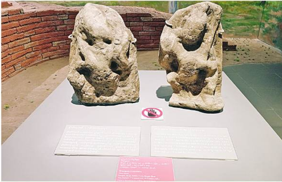
အမျိုးသားပြတိုက်အတွင်းရှိ ဒွါရပါလနတ်ရုပ်များကို တွေ့ရစဉ်။

မိမိတို့အမျိုးအနွယ်၏သမိုင်းစဉ်ကို ပညာရေးဌာနက ပြဋ္ဌာန်းထားသော သမိုင်းစာပေများ သင်ကြားခြင်းနှင့် ကိုယ်တိုင်လေ့လာခြင်းတို့ဖြင့် သိရှိနိုင်သည်။ ကိုယ်တိုင်လေ့လာရာ၌ အချိန်တိုတို၊ တစ်နေရာတည်း၊ ပြည်ပြည်စုံစုံသိရှိရန် လေ့လာလိုသူများအတွက်မူ အမျိုးသားပြတိုက်(နေပြည်တော်)ကို ညွှန်ပြလိုသည်။ ပုဂံခေတ်ဝတ်စားဆင်ယင်မှုအကြောင်း လေ့လာရန် အမျိုးသားပြတိုက်(နေပြည်တော်)သို့ ရောက်ရှိလေ့လာခဲ့သည်မှ မိမိတို့နိုင်ငံသားတိုင်း မရောက်မဖြစ်လေ့လာသင့်သည် နေရာတစ်ခုဖြစ်ကြောင်း သိရှိခဲ့ရသည်။