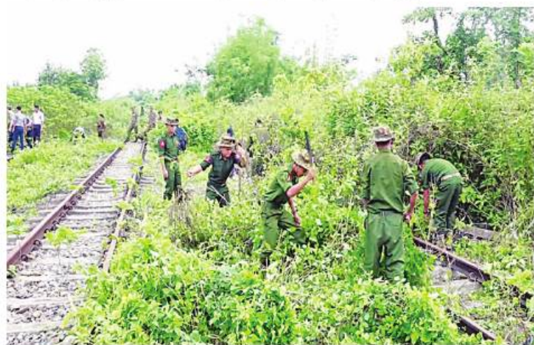
မြစ်ကြီးနားမြို့နှင့် မိုးကောင်းမြို့ထိ မြန်မာ့မီးရထား ပြန်လည်ပြေးဆွဲနိုင်ရေး အတွက် ရထားသံလမ်းများရှိ ချဲ့နွယ်ပေါင်းမြက်များကို နယ်မြေခံတပ်မတော်သားများနှင့် မြန်မာနိုင်ငံရဲတပ်ဖွဲ့ဝင်များက စုတ်ထွင်ရှင်းလင်းကြခြင်း

နေပြည်တော် ၇ ဇူလိုင် - ဒေသခံပြည်သူများ ကုန်စည်ပို့ဆောင်မှုနှင့် သွားလာမှုများအဆင်ပြေချောမွေ့စေရေးအတွက် ကချင်ပြည်နယ် မြစ်ကြီးနားမြို့နှင့် မိုးကောင်းမြို့ထိ မြန်မာ့မီးရထား ပြန်လည်ပြေးဆွဲနိုင်ရေးအတွက် ရထားသံလမ်းများရှိ ချဲ့နွယ်ပေါင်းမြက်များ ခုတ်ထွင်ရှင်းလင်းခြင်းကို ဇွန် ၂၉ ရက်မှ ယနေ့ထိ မြစ်ကြီးနားမြို့ ဘူတာကြီးမှ မိုးကောင်းမြို့သို့သွားရောက်သည့် ရထားသံလမ်း ဝဲယာရှိ ချဲ့နွယ်ပေါင်းမြက်များကို မြောက်ပိုင်းတိုင်းစစ်ဌာနချုပ် ကွပ်ကဲမှု အောက်ရှိ နယ်မြေခံတပ်မတော်သားများနှင့် မြန်မာနိုင်ငံရဲတပ်ဖွဲ့ဝင်များက စုပေါင်းရှင်းလင်းဆောင်ရွက်ခဲ့ကြသည်။ အဆိုပါ ရထားသံလမ်းသည် ကချင်ပြည်နယ် မြစ်ကြီးနားမြို့မှ မန္တလေးမြို့၊ မန္တလေးမြို့မှ ရန်ကုန်မြို့သို့ ယခင်ပြေးဆွဲလျက်ရှိသည်။ ထို့ကြောင့် ရထားပြေးဆွဲမှု မရှိသည်မှာ နှစ်အနည်းငယ်ကြာမြင့်ခဲ့