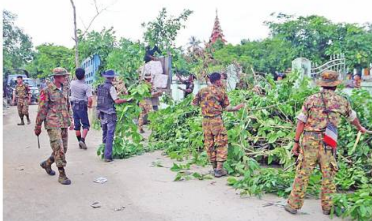
တပ်မတော်သားများ၊ မြန်မာနိုင်ငံရဲတပ်ဖွဲ့ဝင်များနှင့် မီးသတ်တပ်ဖွဲ့ဝင်များ စုပေါင်းသန့်ရှင်းရေးဆောင်ရွက်ကြစဉ်။

အလားတူ မောင်တောမြို့သို့ ရောက်ရှိ နေသည့် ဗိုလ်မှူးချုပ်အောင်သူဦးနှင့် တာဝန်ရှိသူများသည် ကျောက်တော် ရပ်ကွက်ရှိ မြို့နယ်လူ့ဝန်ထမ်းရုံး(လျာထား) မြေနေရာ၌ စုပေါင်းသန့်ရှင်းရေးဆောင်ရွက် နေမှုများကို ကြည့်ရှုစစ်ဆေးသည်။ အလားတူ မောင်တောမြို့သို့ ရောက်ရှိ နေသည့် ဗိုလ်မှူးချုပ်အောင်သူဦးနှင့် တာဝန် ရှိသူများသည် တပ်မတော်သားများ၊ မြန်မာနိုင်ငံရဲတပ်ဖွဲ့ဝင်များ၊ မီးသတ် တပ်ဖွဲ့ဝင်များ၊ ဒေသခံပြည်သူများက ကူညီတန်း ဗိုလ်မှူးရွာအဝင်လမ်း အရှည် ပေ ၁၅၀၀ ရှိ ရေမြောင်းကို ရေစီးရေလာ ကောင်းမွန်စေရေး ဆောင်ရွက်နေမှု၊ မြို့မတောင်ရပ်ကွက်ရှိ အမှတ်(၂)အခြေခံ ပညာအထက်တန်းကျောင်း သန့်ရှင်း သာယာလှပရေး ကျောင်းဝင်းအတွင်းရှိ မြက်ပင်၊ ပေါင်းပင်များ၊ ချွံနွယ်များ၊ အမှိုက်သရိုက်များ ရှင်းလင်းဆောင်ရွက် နေမှုများကို ကြည့်ရှုအားပေးကြသည်။ ထို့ပြင် မုန်တိုင်းဘေးကြောင့် လေဘေးသင့် ပြီး မြို့တွင်းသို့ သွယ်တန်းထားသော ၁၁ ကေပို့ ဓာတ်အားလိုင်းကြိုးများကို ပြန်လည်ပြုပြင် ဆောင်ရွက်နေမှုများအား ကြည့်ရှုစစ်ဆေးပြီး လိုအပ်သည်များ ပေါင်းစပ်ညှိနှိုင်း ဆောင်ရွက်ပေးခဲ့ကြောင်း သတင်းရရှိသည်။