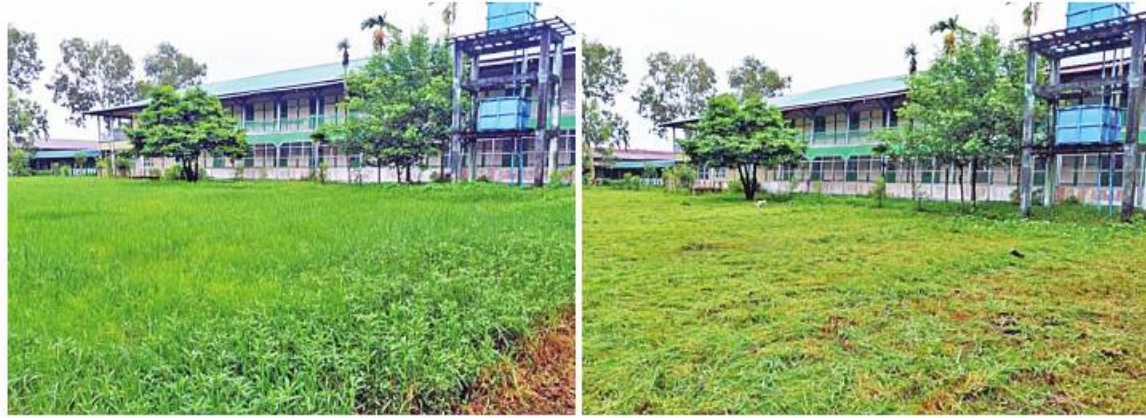
မန္တလေးတိုင်းဒေသကြီး တံတားဦးမြို့နယ် အခြေခံပညာအထက်တန်းကျောင်းအတွင်း စုပေါင်းသန့်ရှင်းရေးမဆောင်ရွက်မီ (ဝဲပုံ)နှင့် သန့်ရှင်းရေးဆောင်ရွက်ပြီး(ယာပုံ)ကို တွေ့ရစဉ်။

နေပြည်တော် ဇူလိုင် ၁ မိမိတို့၏ နေ့စဉ်လူမှုဘဝ နေထိုင် ဖြတ်သန်းရာတွင် ကျန်းမာရွှင်လန်းသော လူမှုပတ်ဝန်းကျင်ကို ပိုင်ဆိုင်နိုင်ရေးအတွက် ကိုယ်စိတ်နှလုံးချမ်းမြေ့ဖွယ်ရာ မျက်စိပညာပေးခြင်းဖြင့် ကျန်းမာရေးနှင့် ညီညွတ်သည့် ပတ်ဝန်းကျင်တစ်ခုရှိရန် အလွန်လိုအပ်ကြောင်းလှည့်လည်။ မိမိတို့ တစ်ဦးချင်းနေထိုင်ကြသည့် ပတ်ဝန်းကျင် သန့်ရှင်းသပ်ရပ်နေမှုသာလျှင် သန့်ရှင်းသာယာလှပသော မြို့ရွာ Clean City၊ Clean Village များ ဖြစ်လာမည်ဖြစ်ပြီး ကျန်းမာရေးနှင့် ညီညွတ်မျှတမည် ဖြစ်သည်အတွက် မိမိဒေသ၊ မိမိမြို့ရွာ