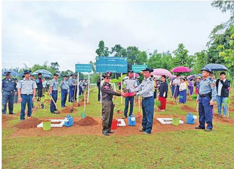
မိုင်းကိုင် ၅ ဇူလိုင် - ရှမ်းပြည်နယ်(တောင်ပိုင်း) မိုင်းကိုင်မြို့နယ်တွင် ၂၀၂၃ ခုနှစ် မိုးရာသီသစ်ပင်စိုက်ပျိုးပွဲတော်ကို ယနေ့နံနက် ၈ နာရီက လွယ်ပူတောက်ကျေးရွာတွင် ပြုလုပ်သည်။ ရှေးဦးစွာ တာဝန်ရှိသူများက သစ်ပင်စိုက်ပျိုးပွဲသို့ တက်ရောက်လာသော ဌာနဆိုင်ရာများ၊ ဒေသခံပြည်သူများကို