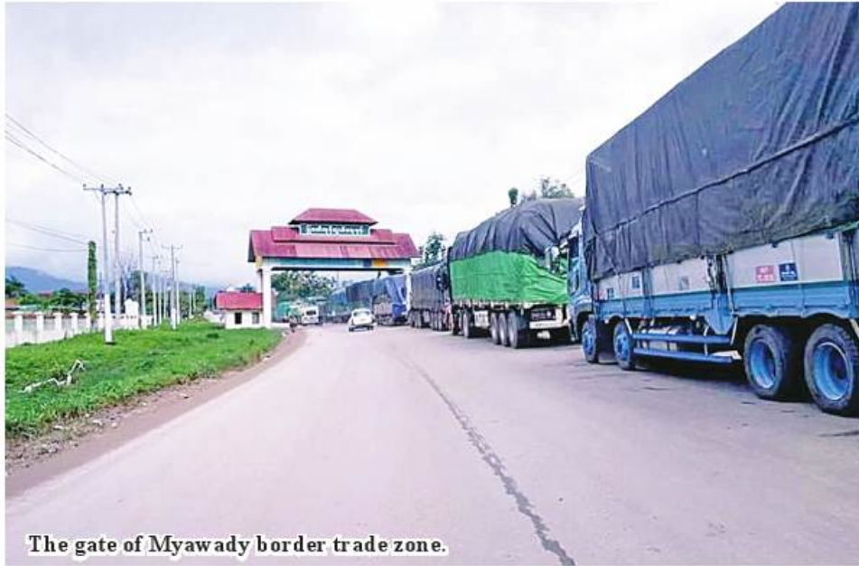
The gate of Myawady border trade zone.

Myawady June 25 Myawady border trade camp handles a larger volume of agricultural produce and marine products to Thailand, according to the Myanmar Trade Promotion Organization on 24 June. At the border trade zone, forex rate is stable at K85.11 per baht. At present, tourism market is active in Thailand