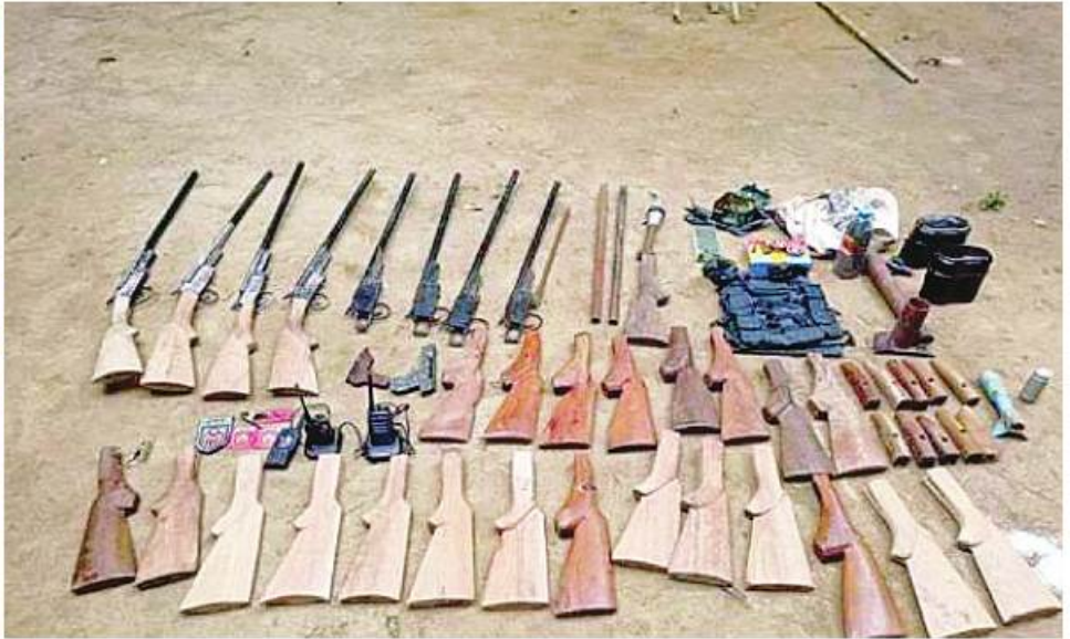
လက်ပံတောကျေးရွာအနီး PDF အမည်ခံအကြမ်းဖက်သမားများထံမှ သိမ်းဆည်းရမိခဲ့သည့် လက်နက်၊ ခဲယမ်းများနှင့်ဆက်စပ်ပစ္စည်းများ ဖုတ်တမ်းဓာတ်ပုံ။