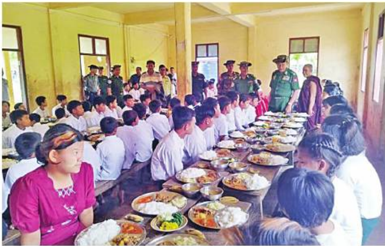
ရခိုင်ပြည်နယ် နယ်စပ်ဒေသကန္တာရီလူငယ်ဖွံ့ဖြိုးရေးပရဟိတသင်တန်းကျောင်းရှိ ကျောင်းသား၊ ကျောင်းသူများကို အာဟာရဖြည့်စားသောက်ဖွယ်ရာများ ကျွေးမွေးစဉ်။

နေပြည်တော် ၅ ဇူလိုင် - ဆိုင်ကလုန်းမုန်တိုင်း(မိုခါ) တိုက်ခတ်မှုကြောင့် ထိခိုက်ပျက်စီးခဲ့သည့် ဒေသများကို သဘာဝဘေးအန္တရာယ်ဆိုင်ရာ စီမံခန့်ခွဲမှုဥပဒေပုဒ်မ ၁၁ အရ သဘာဝဘေးအန္တရာယ်ကျရောက်သော ဒေသများအဖြစ် ကြေညာချက်များထုတ်ပြန်၍ ယင်းကြေညာချက်များပါ ဒေသများတွင် ပြန်လည်ထူထောင်ရေးလုပ်ငန်းများ ဆောင်ရွက်နိုင်ရန် ဒေသအလိုက် တပ်မတော် အရာရှိကြီးများကို ခန့်အပ်တာဝန်ပေးထားပြီးဖြစ်သည်။ ထိုသို့ ပြန်လည်ထူထောင်ရေးလုပ်ငန်းများဆောင်ရွက်ရန်အတွက် ခန့်အပ်