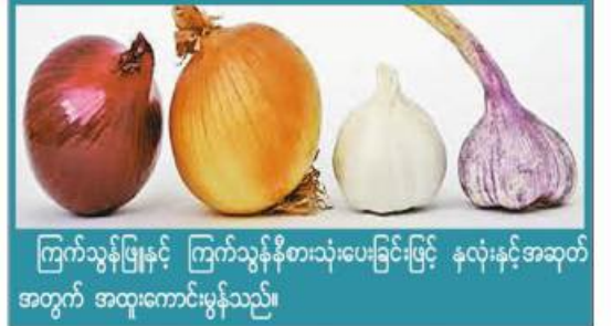
ကြက်သွန်ဖြူနှင့် ကြက်သွန်နီစားသုံးပေးခြင်းဖြင့် နှလုံးနှင့်အဆုတ်အတွက် အထူးကောင်းမွန်သည်။