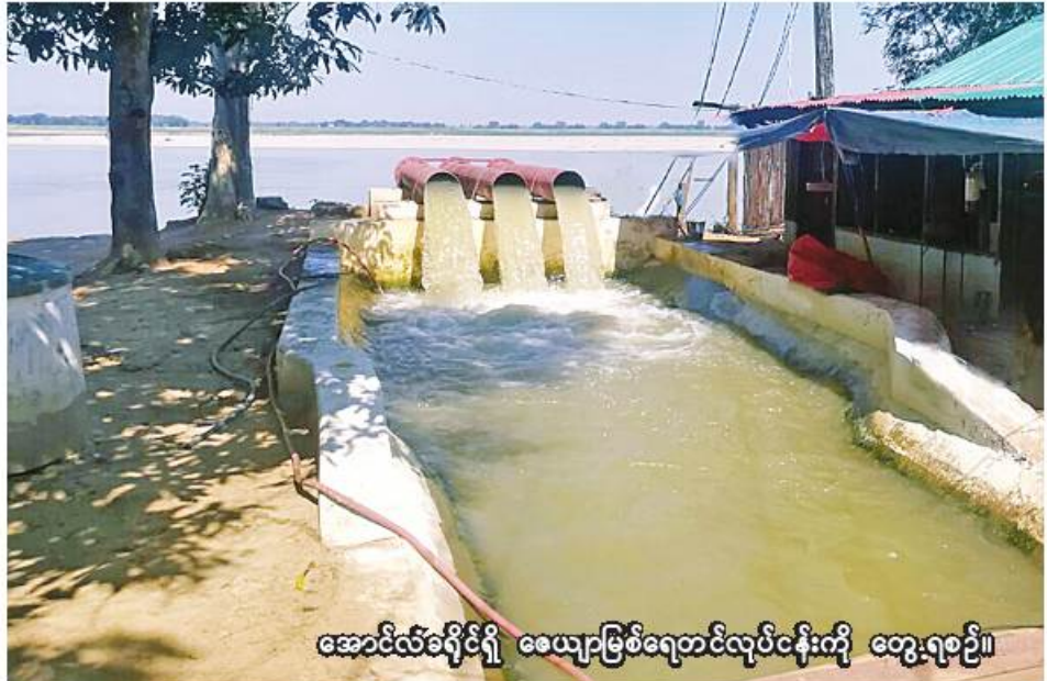
အောင်လံခရိုင်ရှိ ဝေယျာမြစ်ရေတင်လုပ်ငန်းကို တွေ့ရစဉ်။