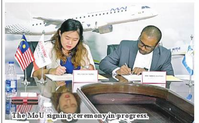
The MoU signing ceremony in progress.