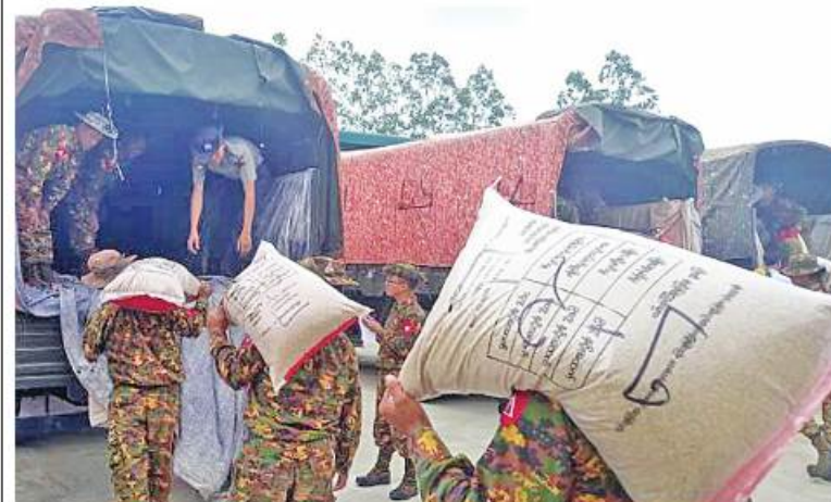
ရခိုင်ပြည်နယ်အတွင်း မိုးစပါးအချိန်စီစိုက်ပျိုးနိုင်ရန် နယ်မြေခံတပ်မတော်သားများနှင့် မြန်မာနိုင်ငံရဲတပ်ဖွဲ့ဝင်များက မော်တော်ယာဉ်ပေါ်သို့ ကူညီတင်ဆောင်ပေးစဉ်။

□ မိုးစပါးအချိန်စီစိုက်ပျိုးနိုင်ရန်မှ လိုအပ်သည်မျိုးစပါးများကို တင်ပို့ပေးနိုင်ရန် စီမံဆောင်ရွက်လျက်ရှိသည်။ ထိုသို့ စီမံဆောင်ရွက်လျက်ရှိရာ ရောဝတီတိုင်းဒေသကြီး မြောင်းမြမြို့မှ ဝယ်ယူခဲ့သည့် ပေါ်ဆန်းရင်မျိုးစပါး တင်း ၁၄၀၀၀ ကို တပ်မတော်မော်တော်ယာဉ် ၆၃ စီးဖြင့် လည်းကောင်း၊ နေပြည်တော်ကောင်စီနယ်မြေမှ ဝယ်ယူခဲ့သည့် GW-11 မျိုးစပါး ၉၂၅၃ တင်းကို တပ်မတော်မော်တော်ယာဉ် ၄၇ စီးဖြင့် လည်းကောင်း၊ ပဲခူးတိုင်းဒေသကြီး ရေတာရှည်မြို့နယ်မှ ဝယ်ယူခဲ့သည့် နံ့ကောက်မျိုးစပါး တင်း ၄၃၃၀ ကို