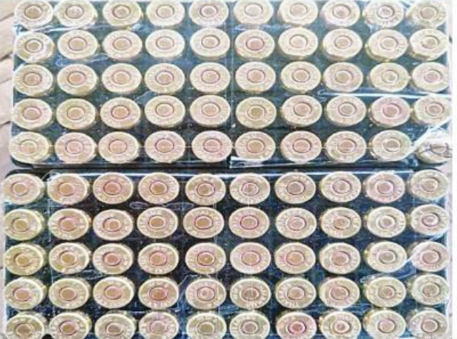
ဥယျာဉ်ကျေးရွာအနီး PDF အမည်ခံအကြမ်းဖက်သမားများထံမှ သိမ်းဆည်းရမိခဲ့သည့် လက်နက်၊ ခဲယမ်းများနှင့် ဆက်စပ်ပစ္စည်းများ ဖုတ်တမ်းဓာတ်ပုံ။