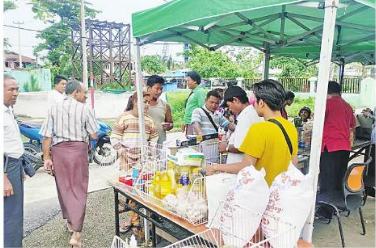
မှန်တိုင်းဒဏ်သင့်ပြည်သူများအား ဆန်၊ ဆီ၊ ဆား၊ ကြက်ဥ၊ ဟင်းသီးဟင်းရွက်များနှင့် စားသောက်ကုန်ပစ္စည်းများကို ဈေးနှုန်းသက်သာစွာဖြင့် ရောင်းချပေးစဉ်။

နေပြည်တော် ဇွန် ၂၅ ဆိုင်ကလုန်းမုန်တိုင်း (မိုခါ)တိုက်ခတ်မှုကြောင့် ပျက်စီးမှုများဖြစ်ပေါ်ခဲ့သည့် စစ်တွေမြို့ရှိ မုန်တိုင်းဒဏ်သင့် ဒေသခံပြည်သူများနှင့် ဌာနဆိုင်ရာဝန်ထမ်းများ၏ စားသောက်ရေးအဆင်ပြေစေရန်နှင့် မိမိတို့အလိုရှိရာ စားသောက်ကုန်ပစ္စည်းများကို ဈေးနှုန်းသက်သာစွာဖြင့် ဝယ်ယူစား