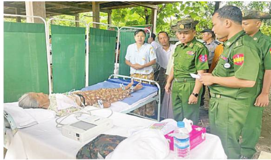
အနောက်မြောက်တိုင်း စစ်ဌာနချုပ်မှ နယ်မြေခံစားကုသရေးအဖွဲ့များက ဒေသခံပြည်သူများအား ကျန်းမာရေးစောင့်ရှောက်မှုလုပ်ငန်းများ ဆောင်ရွက်ပေးနေမှုကို တာဝန်ရှိသူများက ကြည့်ရှုစဉ်။

အရိုးနှင့်ဆိုင်သောရောဂါ၊ အစာအိမ်နှင့် အူလမ်းကြောင်းရောဂါ၊ အသည်းရောဂါ၊ သားဖွားမီးယပ်ရောဂါ၊ မျက်စိရောဂါ၊ ဝမ်းပျက်၊ ဝမ်းလျော့ရောဂါ၊ အထွေထွေရောဂါတို့နှင့်ပတ်သက်၍ ဒေသခံပြည်သူ ၁၅၅ ဦးတို့ကို လိုအပ်သည် ကျန်းမာရေးစောင့်ရှောက်မှုလုပ်ငန်းများ ဆောင်ရွက်ပေးသည်။ ယင်းသို့ ဆောင်ရွက်ပေးနေမှုများကို တိုင်းစစ်ဌာနချုပ်မှ တာဝန်ရှိသူများက သွားရောက်ကြည့်ရှုအားပေးပြီး လိုအပ်သည်များ ပြည့်ဆည်းဆောင်ရွက်ပေးခဲ့ကြောင်း သတင်းရရှိသည်။ > > >