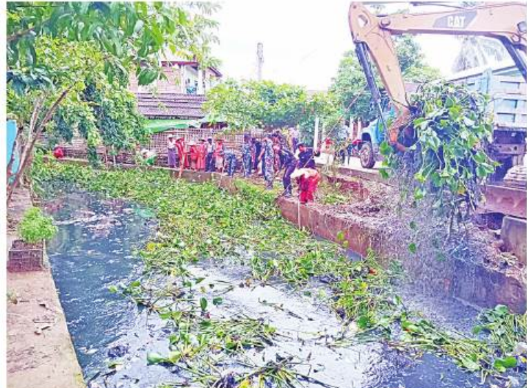
သဘာဝဘေးအန္တရာယ်ကျရောက်သောဒေသများတွင် တပ်မတော်မှ ကူညီကယ်ဆယ်ရေးအဖွဲ့များက ကူညီကယ်ဆယ်ရေးနှင့် ပြန်လည်ထူထောင်ရေးလုပ်ငန်းများ ပူးပေါင်းပါဝင်ဆောင်ရွက်ပေးစဉ်။

နေပြည်တော် ၅ ဇူလိုင် - သဘာဝဘေးအန္တရာယ် ကျရောက်ခဲ့ရသည့် ဒေသများတွင် လိုအပ်သည့် ကူညီကယ်ဆယ်ရေးနှင့် ပြန်လည်ထူထောင်ရေးလုပ်ငန်းများ ကူညီဆောင်ရွက်ပေးနိုင်ရေးအတွက် တပ်မတော်က ကြိုတင်စုဖွဲ့စေလွှတ်ထားသည့် ကူညီကယ်ဆယ်ရေးအဖွဲ့များသည် နယ်မြေခံလုံခြုံရေးတပ်ဖွဲ့ဝင်များ၊ လူမှုကယ်ဆယ်ရေးအဖွဲ့များနှင့် ပူးပေါင်း၍ သက်ဆိုင်ရာဒေသများတွင် အင်တိုက်အားတိုက် ကူညီဆောင်ရွက်ပေးလျက်ရှိသည်။ ထိုသို့ ဆောင်ရွက်ပေးလျက်ရှိရာ ယနေ့တွင် ဘူးသီးတောင်မြို့သို့ ရောက်ရှိနေသည့် ကူညီကယ်ဆယ်ရေးအဖွဲ့များသည် ဌာနဆိုင်ရာဝန်ထမ်းများနှင့် ပူးပေါင်း၍ မြို့တွင်းရေမြောင်းများ ရေစီးရေလာကောင်းမွန်စေရန်အတွက် သန့်ရှင်းရေး