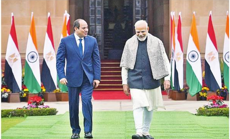
ကိုင်းရို ဇူန် ၂၅ အီဂျစ်သမ္မတ အယ်လ်စီစီသည် ယနေ့တွင် ကိုင်းရိုမြို့၌ အိန္ဒိယ ဝန်ကြီးချုပ် မိုဒီနှင့် တွေ့ဆုံဆွေးနွေးခဲ့ကြောင်း အေပီသတင်းဌာနက ဖော်ပြခဲ့သည်။ အိန္ဒိယဝန်ကြီးချုပ် မိုဒီသည် အီဂျစ်နိုင်ငံကို ခရီးစဉ်အဖြစ် နှစ် ၂၀ ကျော်ကာလအတွင်း အီဂျစ် ဇူန် ၂၄ ရက်တွင် ကိုင်းရိုမြို့သို့ နိုင်ငံသို့ တရားဝင်နိုင်ငံတော်အဆင့် လေကြောင်းခရီးဖြင့် ရောက်ရှိ ခရီးစဉ်ဖြင့် ရောက်ရှိလာခဲ့သည် ဖြစ်သည်။

ပထမဆုံး အိန္ဒိယဝန်ကြီးချုပ် ဖြစ်သည်။ အီဂျစ်သမ္မတ အယ်လ်စီစီသည် အိန္ဒိယဝန်ကြီးချုပ်ကို ကိုင်းရိုမြို့ သမ္မတနန်းတော်၌ ယနေ့နံနက်ပိုင်း တွင် ကြိုဆိုနှုတ်ဆက်ခဲ့သည်။ ဆွေးနွေးပွဲပြီးဆုံးချိန်တွင် အီဂျစ် သမ္မတ အယ်လ်စီစီသည် ဧည့်သည် တော် အိန္ဒိယဝန်ကြီးချုပ်ကို အီဂျစ် နိုင်ငံ၏ အမြင့်ဆုံးဂုဏ်ပြုဘွဲ့တံဆိပ် ဖြစ်သော နိုင်းဘွဲ့တံဆိပ် (Order of Nile) ကို ဂုဏ်ပြုပေးအပ်ခဲ့ ကြောင်း အီဂျစ်မီဒီယာများက သတင်းထုတ်ပြန်ထားသည်။ အီဂျစ်နှင့်အိန္ဒိယနိုင်ငံတို့သည် ၁၉၅၀ ပြည့်နှစ်ကာလများကပင် ဆက်ဆံရေး ခိုင်မာအားကောင်းခဲ့ သော နိုင်ငံများဖြစ်ကြကြောင်း သိရသည်။ KKO