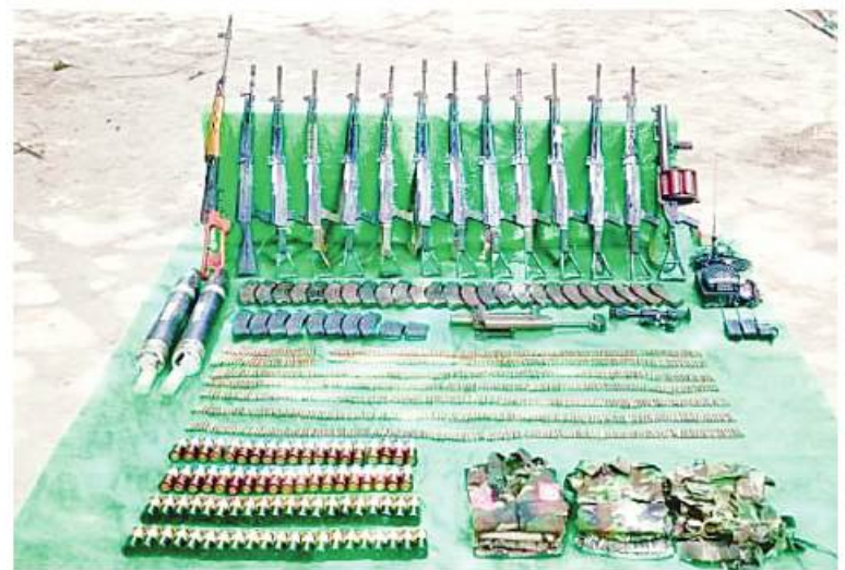
ကင်းတော်ကျေးရွာအနီး PDF အမည်ခံအကြမ်းဖက်သမားများထံမှ သိမ်းဆည်းရမိခဲ့သည့် လက်နက်၊ ခဲယမ်းများနှင့် ဆက်စပ်ပစ္စည်းများ ဖုတ်တမ်းဓာတ်ပုံ။

ဆက်စပ်ပစ္စည်းများကို ထပ်မံသိမ်းဆည်းရရှိခဲ့သည်။ အဆိုပါ သိမ်းဆည်းရမိလက်နက်များနှင့်ဆက်စပ်ပစ္စည်းများကို လုပ်ထုံးလုပ်နည်းများနှင့်အညီ ဆက်လက်ဆောင်ရွက်သွားမည်ဖြစ်ကြောင်းနှင့် အကြမ်းဖက်အဖွဲ့များအနေဖြင့် အဆိုပါလက်နက်များက တိုင်ဆောင်၍ ဒေသခံပြည်သူများကိုအခိုင်ကျင့်ဖိုလ်ကျခြင်း၊ နိုင်ငံ့ဝန်ထမ်းများနှင့် အပြစ်မဲ့ပြည်သူများအပေါ် စိတ်မထင်လျှင် မထင်သလို သတ်ဖြတ်ခြင်းများ ဆောင်ရွက်လျက်ရှိရာ ရပ်ရွာတည်ငြိမ်အေးချမ်းအတွက် လုံခြုံရေးတပ်ဖွဲ့ဝင်များနှင့်အတူ ပြည်သူတစ်ရပ်လုံး ပိုင်းဝန်းပူးပေါင်းဆောင်ရွက်ပေးနိုင်ရန် သတင်းထုတ်ပြန်အပ်ပါသည်။