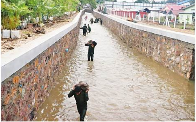
အလယ်ပိုင်းတိုင်းစစ်ဌာနချုပ်မှ နယ်မြေခံစားကုသရေးအဖွဲ့များက ဂဲလောင်းချောင်းတစ်လျှောက် ရေစီးရေလာကောင်းမွန်စေရေး သန့်ရှင်းရေးဆောင်ရွက်ပေးစဉ်။

ထိုသို့ ဆောင်ရွက်နေမှုများကို တပ်နယ်မှ တာဝန်ရှိသူများနှင့် ခရိုင်၊ မြို့နယ်မှ တာဝန်ရှိသူများက သွားရောက်ကြည့်ရှုအားပေးကာ ဂဲလောင်းချောင်းတစ်လျှောက်နှင့် အမျိုးသားကန်တော်ကြီးဥယျာဉ်၊ ကန်တော်ကြီး၊ ကန်တော်လေးရေကန်များအတွင်းသို့ ရေဝင်ရောက်မှုနှင့် ရေပိုလွှဲမှု ရေများစီးဆင်းနေမှုများကို သွားရောက်ကြည့်ရှုစစ်ဆေးခဲ့ကြကြောင်း သတင်းရရှိသည်။