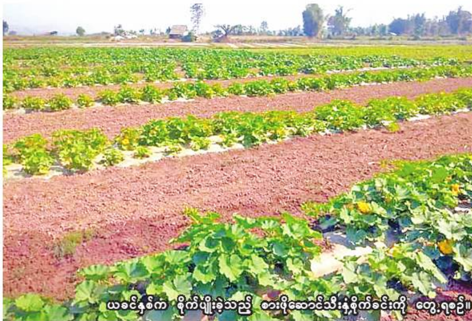
ယခင်နှစ်က စိုက်ပျိုးခဲ့သည့် စားဖိုဆောင်သီးနှံစိုက်ခင်းကို တွေ့ရစဉ်။

လပွတ္တာ ဧရိယာ ၅၂ ရာစုတို့တိုင်းဒေသကြီး လပွတ္တာ မြို့နယ်တွင် ယခုနှစ် မိုးသီးနှံ စိုက်ပျိုးရာသီ၌ စားဖိုဆောင်သီးနှံ ကေ ၆၇၀၀ စိုက်ပျိုးသွားမည်ဖြစ်ကြောင်း လပွတ္တာမြို့နယ် စိုက်ပျိုးရေးဦးစီးဌာန မြို့နယ်ဦးစီးမှူး