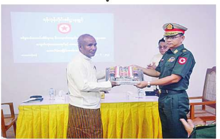
ရန်ကုန်တိုင်းစစ်ဌာနချုပ် ဒုတိယတိုင်းမှူး ဗိုလ်မှူးချုပ်ဝင်းမြင့်နိုင် စစ်မှုထမ်းဟောင်း အိမ်ရာနေ မိသားစုဝင် ကျောင်းသား၊ ကျောင်းသူများအတွက် ကျောင်းသုံးပလာစတစ်အုပ်များ နှင့်စာရေးကိရိယာများ ထောက်ပံ့ပေးအပ်စဉ်။

နေပြည်တော် ၅.၆.၂၂ ရန်ကုန်တိုင်းဒေသကြီး ဒဂုံမြို့သစ် (တောင်ပိုင်း)မြို့နယ် စစ်မှုထမ်းဟောင်း အိမ်ရာ(လေးထောင့်ကန်)ရှိ မိသားစုဝင် ကျောင်းသား၊ကျောင်းသူများအား ကျောင်းသုံး ပလာစတစ်အုပ်များနှင့် စာရေးကိရိယာများ ထောက်ပံ့ပေးအပ်ခြင်းကို ၅.၆.၂၁ ရက် နေ့လယ်ပိုင်းတွင် အဆိုပါအိမ်ရာ၌ ပြုလုပ် ရာ ရန်ကုန်တိုင်းစစ်ဌာနချုပ် ဒုတိယတိုင်းမှူး ဗိုလ်မှူးချုပ်ဝင်းမြင့်နိုင်နှင့် တာဝန်ရှိသူများ စစ်မှုထမ်းဟောင်းအဖွဲ့ဝင်များနှင့် မိသားစု ဝင်များ တက်ရောက်ကြသည်။ ဦးစွာ ဒုတိယတိုင်းမှူးက အမှာစကား ပြောကြားသည်။ ထို့နောက် ဒုတိယတိုင်းမှူးက စစ်မှုထမ်းဟောင်းအိမ်ရာနေ မိသားစုဝင် ကျောင်းသား၊ ကျောင်းသူများအတွက် ကျောင်းသုံးပလာစတစ်အုပ်များနှင့် စာရေး ကိရိယာများ ထောက်ပံ့ပေးအပ်ရာ တာဝန် ရှိသူတစ်ဦးက လက်ခံရယူခဲ့သည်။ ယင်းနောက် စစ်မှုထမ်းဟောင်းအဖွဲ့ဝင် များနှင့် မိသားစုဝင်များ၏ တင်ပြချက်များ အပေါ် လိုအပ်သည်များပေါင်းစပ်ညှိနှိုင်း ဆောင်ရွက်ပေးပြီး စစ်မှုထမ်းဟောင်း အိမ်ရာ(လေးထောင့်ကန်) ဝင်းအတွင်း လှည့်လည်ကြည့်ရှုစစ်ဆေးခဲ့ကြောင်း သတင်း ရရှိသည်။