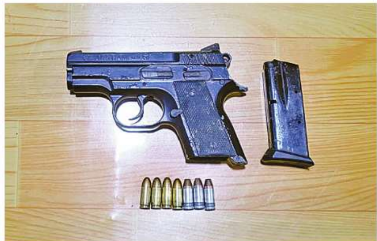
ဓမ္မသီရိမြို့နယ် ရူးတောရွာနှင့် အလျင်လိုရွာကြား လမ်းဘေးသစ်ပင်အောက်၌ သိမ်းဆည်းရမိခဲ့သည့် လက်နက်၊ ခဲယမ်းများ မှတ်တမ်းဓာတ်ပုံ။