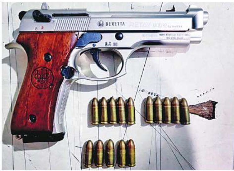
ဒက္ခိဏသီရိမြို့နယ် သီရိမင်္ဂလာကျေးရွာရှိ တရားမဖြင့်ကျော်(စ)အသေးလေး၏နေအိမ်မှ သိမ်းဆည်းရမိခဲ့သည့် လက်နက်၊ ခဲယမ်းများ၏ မှတ်တမ်းဓာတ်ပုံ။

အထက်ပါ ဖမ်းဆီးရမိတရားခံများ ကို ဥပဒေအရ ထိရောက်စွာ အရေးယူနိုင်ရေး ဆက်လက် ဆောင်ရွက်သွားမည်ဖြစ်ကြောင်း၊ အကြမ်းဖက်မှုဆောင်ရွက်နေသူများကို ပြည်သူတစ်ရပ်လုံးက ဝိုင်းဝန်းတာကြွယ်တိုက်ဖျက်ကြရန်နှင့် ဆက်စပ်တရားခံများကို အမြန်ဆုံးဖမ်းဆီးရမိရေးအတွက် ၎င်းတို့ တိမ်းရှောင်နေသည့်နေရာများ၊ လှုပ်ရှားသွားလာနေထိုင်မှုသတင်းများရရှိပါက သက်ဆိုင်ရာသို့ လျှို့ဝှက်စွာ သတင်းပေး တိုင်ကြားနိုင်ကြောင်း၊ သတင်းပေးသူနှင့် ဖမ်းဆီးပေးသူများကို ထိုက်တန်စွာ လျှို့ဝှက်၍ ဆုငွေများချီးမြှင့်ပေးလျက်ရှိကြောင်းနှင့် မြို့ရွာများ အမြန်ဆုံးအေးချမ်းတည်ငြိမ်ရေးအတွက် ပြည်သူတစ်ရပ်လုံး ပူးပေါင်းပါဝင် ကြိုးပမ်းဆောင်ရွက်နိုင်ရန် မေတ္တာရပ်ခံအပ်ပါကြောင်း အသိပေးသတင်း ထုတ်ပြန်အပ်ပါသည်။