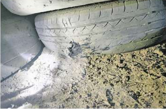
၂၀၂၃ ခုနှစ် မတ် ၂ ရက်တွင် ဝဗ္ဗသီရိမြို့နယ် ရှိုင်းရွာလမ်းဆုံရှိ ရဲကင်းစခန်းကို လက်ပစ်ခဲဖြင့် ပစ်ခတ်ဖောက်ခွဲခဲ့သည့် မှတ်တမ်းဓာတ်ပုံ။