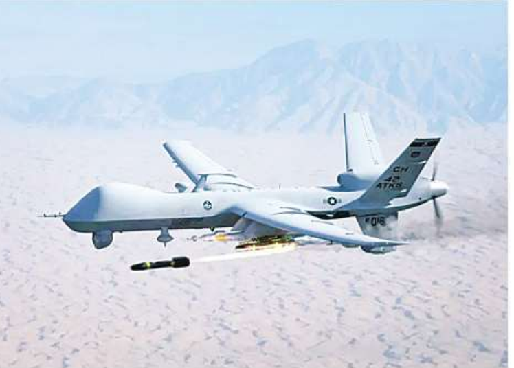
မျှော်မှန်းထားသည်။ US Approves Sale of Four Reaper Drones to Netherlands ကို ဘာသာပြန်ဆိုထားပါသည်။

ကြားခဲ့ကြောင်း သိရသည်။ တစ်ချိန်တည်းတွင် နိုင်ငံအနေဖြင့် လုံခြုံရေးစိုးရိမ်မှုများ တိုးမြှင့်လာခြင်းကြောင့် ၎င်း၏လက်ရှိ MQ-9A ဒရုန်းများကို တိုက်ခိုက်ရေးဒရုန်းများအဖြစ် ပြုပြင်ပြောင်းလဲသွားမည်ဖြစ်ကြောင်း သိရသည်။ NATO အဖွဲ့ဝင်နိုင်ငံ တစ်နိုင်ငံဖြစ်သည့် နယ်သာလန်နိုင်ငံသည် ၎င်း၏ MQ-9A ဒရုန်းလေးစင်းကို လေ့လာလမ်းညွှန် GBU ပုံထိန်းခွဲများနှင့် ဝေဟင်မှမြေပြင်ပစ် ငရဲမီးခွဲကျည်များတပ်ဆင်ရန် အမေရိကန်ဒေါ်လာ ၂၆၈ သန်းထိ အကျန်အကျခံ ပြုပြင်ပြောင်းလဲသွားမည်ဖြစ်ကြောင်း သိရသည်။ ပထမဆုံး တိုက်ခိုက်ရေးဒရုန်းကို ၂၀၂၅ ခုနှစ်တွင် တပ်ဖြန့်အသုံးပြုရန်