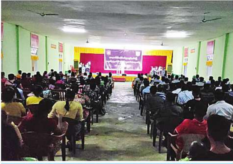
ရခိုင်ပြည်နယ်အတွင်း မိုခါမုန်တိုင်းသင့်ဒေသများတွင် ပြန်လည်ထူထောင်ရေးလုပ်ငန်းများဆောင်ရွက်လျက်ရှိသည့် နယ်မြေခံတပ်မတော်သားများ၊ မြန်မာနိုင်ငံရဲတပ်ဖွဲ့ ဝင်များ၊ မီးသတ်တပ်ဖွဲ့ ဝင်များနှင့် မိသားစုဝင်များကို နယ်လှည့်ပြည်သူ့ ဆက်ဆံရေးတပ်ခွဲက ကပြသီဆိုဖျော်ဖြေစဉ်။

နေပြည်တော် ၇ ဇူလိုင် ၂၂ ရခိုင်ပြည်နယ်အတွင်းရှိ မိုခါမုန်တိုင်းဒဏ်သင့်ဒေသများတွင် ပြန်လည်ထူထောင်ရေးလုပ်ငန်းများ ဆောင်ရွက်လျက်ရှိသည့် အနောက်ပိုင်းတိုင်းစစ်ဌာနချုပ် နယ်မြေခံတပ်မတော်သားများ၊ မြန်မာနိုင်ငံရဲတပ်ဖွဲ့