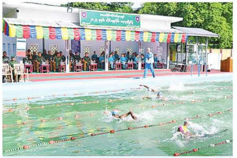
အလယ်ပိုင်းတိုင်းစစ်ဌာနချုပ် တိုင်းမှူးခိုင်းရေကူးပြိုင်ပွဲ ယှဉ်ပြိုင်နေမှုကိုတွေ့ရစဉ်။

များ လျှော့ဒါန်းပေးသည်။ ထို့အတူ မောင်တောမြို့သို့ရောက်ရှိနေသည့် ကူညီကယ်ဆယ်ရေးအဖွဲ့များသည် နယ်လှည့်ဆေးကုသရေးအဖွဲ့များနှင့်ပူးပေါင်း၍ ဝေသာလီရပ်ကွက်ရှိ မင်းထန်နိကာယဝေသာလီကျောင်းတိုက်၌ သံယာတော်များနှင့် ဒေသခံပြည်သူများကို ကျန်းမာရေးစောင့်ရှောက်မှုလုပ်ငန်းများ ကူညီဆောင်ရွက်ပေးလျက်ရှိသည်။ အလားတူ စစ်တွေမြို့သို့ရောက်ရှိနေသည့် ကူညီကယ်ဆယ်ရေးအဖွဲ့များသည် နယ်လှည့်ဆေးကုသရေးအဖွဲ့များနှင့်ပူးပေါင်း၍ အလားတန်ကျေးရွာရှိ ဒေသခံပြည်သူများကို ကျန်းမာရေးစောင့်ရှောက်မှုလုပ်ငန်းများ ကူညီဆောင်ရွက်ပေးလျက်ရှိကြောင်း သတင်းရရှိသည်။