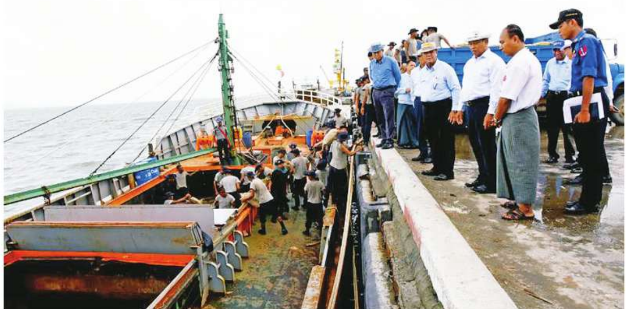
နိုင်ငံတော်စီမံအုပ်ချုပ်ရေးကောင်စီအဖွဲ့ဝင် ဒုတိယဝန်ကြီးချုပ်နှင့်ပြည်ထောင်စုဝန်ကြီး ဗိုလ်ချုပ်ကြီးတင်အောင်စန်း၊ ကူညီကယ်ဆယ် ရေးနှင့်ပြန်လည်ထူထောင်ရေးလုပ်ငန်းများတွင် အသုံးပြုမည့်ပစ္စည်းများ၊ ဘေးသင့်ဒေသများသို့ ပြန်ခွဲပေးနိုင်ရေးစီမံဆောင်ရွက်နေမှု များကို ကြည့်ရှုစစ်ဆေးစဉ်။

စစ်တွေ ၇ နံနက် ၂၂ ရခိုင်ပြည်နယ်အတွင်း မုန်တိုင်းဒဏ်ကြောင့် ပျက်စီးဆုံးရှုံးမှုများ ပြန်လည်ထူထောင်ရေးလုပ်ငန်းများကို အနီးကပ်ကြီးကြပ်ကွပ်ကဲရန် စစ်တွေမြို့၌ ရောက်ရှိနေသော နိုင်ငံတော်စီမံအုပ်ချုပ်ရေးကောင်စီ အဖွဲ့ဝင် ဒုတိယဝန်ကြီးချုပ်နှင့် ပြည်ထောင်စုဝန်ကြီး ဗိုလ်ချုပ်ကြီး တင်အောင်စန်းသည် ပြည်ထောင်စုဝန်ကြီးများဖြစ်ကြသည့် ဒုတိယဗိုလ်ချုပ်ကြီးထွန်းထွန်းနောင်ဦးလှမိုးဦးမျိုးသန့်နှင့်ဒေါက်တာ သက်သက်ခိုင်၊ ဒုတိယဝန်ကြီးများ၊ တာဝန်ရှိသူများနှင့်အတူ ယနေ့ တွင် ဘုန်းတော်ကြီးကျောင်း၊ခရစ်ယာန်ဘုရားရှိခိုးကျောင်းနှင့် ဟိန္ဒူ ဘုရားကျောင်းများပြုပြင်ရေး အလှူငွေပေးအပ်ခြင်းနှင့် ဘိုးဘွား ရိပ်သာများနှင့် လူငယ်ဖွံ့ဖြိုးရေးပရဟိတဂေဟာများသို့ ထောက်ပံ့ ငွေများပေးအပ်ခြင်းအခမ်းအနားသို့ တက်ရောက်ပြီး စစ်တွေမြို့ ဘက်စုံသုံးဆိပ်ကမ်းနှင့် မြန်မာ့ဆိပ်ကမ်းအာဏာပိုင် ဖောင်တော်ကြီး ဆိပ်ခံတံတား၌ ဆိုက်ကပ်ထားသည့် သင်္ဘောများပေါ်မှ ကူညီကယ် ဆယ်ရေးနှင့် ပြန်လည်ထူထောင်ရေးလုပ်ငန်းများတွင် အသုံးပြုမည့် ပစ္စည်းများဘေးသင့်ဒေသများသို့ ပြန်ခွဲပေးနိုင်ရေး စီမံဆောင်ရွက် နေမှုများကို ကြည့်ရှုစစ်ဆေးသည်။ စာမျက်နှာ ၁၆ ကော်လံ ၅ ☆