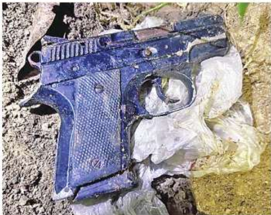
ဓမ္မသီရိမြို့နယ် ရူးတောရွာနှင့် အလျင်လိုရွာကြား လမ်းဘေးသစ်ပင်အောက်၌ သိမ်းဆည်းရမိသည့် လက်နက်၊ ခဲယမ်းများ သွားရောက်ရှာဖွေခဲ့သည့် မှတ်တမ်းဓာတ်ပုံ။