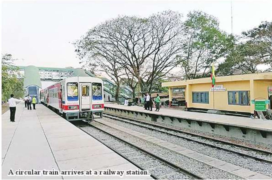
A circular train arrives at a railway station.

are allowed to run before and after office hours for convenience of staff," he added.