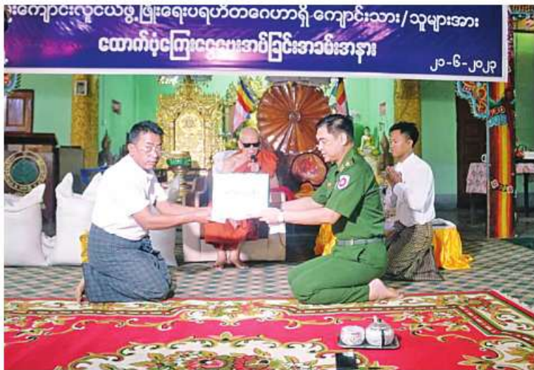
အနောက်ပိုင်းတိုင်းစစ်ဌာနချုပ် ဒုတိယတိုင်းမှူး ဗိုလ်မှူးချုပ်အောင်ကျော်စင်၊ မြို့ဦးကျောင်း လူငယ်ဖွံ့ဖြိုးရေးပရဟိတဂေဟာရှိ ကျောင်းသား၊ ကျောင်းသူများ အတွက် ထောက်ပံ့ငွေများ ပေးအပ်စဉ်။

နေပြည်တော် ၅.၆.၂၂ တွင် အဆိုပါပရဟိတဂေဟာ၌ ကျင်းပရာ ရခိုင်ပြည်နယ် အမ်းခရိုင် အမ်းမြို့ မြို့ဦးကျောင်းတိုက်ဆရာတော် သဒ္ဓမ္မ လေယာဉ်ကွင်းရပ်ကွက် မြို့ဦးကျောင်း လောတိကဓဇ ဘဒ္ဒန္တပညာဓိက၊ အနောက် လူငယ်ဖွံ့ဖြိုးရေး ပရဟိတဂေဟာရှိ ပိုင်းတိုင်းစစ်ဌာနချုပ် ဒုတိယတိုင်းမှူး ကျောင်းသား၊ကျောင်းသူများအား ထောက်ပံ့ ငွေပေးအပ်ခြင်းကို ၅.၆.၂၂ ရက် မွန်းလွဲပိုင်း များ၊ ပရဟိတဂေဟာမှ တာဝန်ရှိသူများ