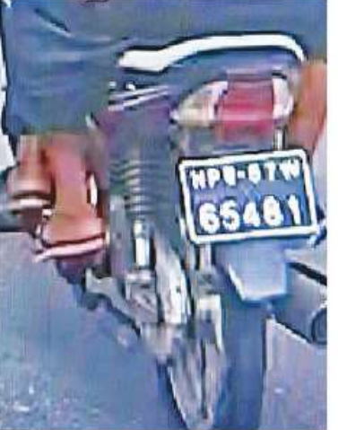
လယ်ဝေးမြို့မရဲစခန်းနှင့် MICC-II ဂိတ်(၂)ဝင်ထွက်ပေါက်ကို လက်ပစ်ခဲဖြင့် ပစ်ခတ်သည့်ဖြစ်စဉ်မှ တရားခံနှစ်ဦး၏ CCTV မှတ်တမ်းဓာတ်ပုံ။