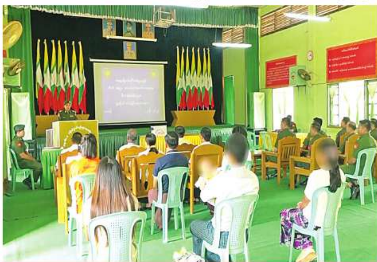
ပြစ်မှုကျူးလွန်ခြင်းမရှိသည့် ဥပဒေဘောင်အတွင်းဝင်ရောက်လာသော PDF အဖွဲ့ဝင် များကို ပြန်လည်လက်ခံ၍ ၎င်းတို့၏ မိဘအုပ်ထိန်းသူများထံ ပြန်လည်လွှဲပြောင်းပေးအပ် ခြင်းအခမ်းအနား ကျင်းပစဉ်။

နေပြည်တော် ၅.၆.၂၂ နိုင်ငံတော် စီမံအုပ်ချုပ်ရေးကောင်စီ သည် PDF အပါအဝင် အဖွဲ့အစည်း အမျိုးမျိုးအမည်ခံ၍ လက်နက်ကိုင်ဆန့်ကျင် လျက်ရှိသည့် အဖွဲ့အစည်းများအတွင်း ရောက်ရှိနေသူများကို ဥပဒေဘောင်အတွင်း သို့ပြန်လည်ဝင်ရောက်ရန် ဖိတ်ခေါ်လျက် ရှိပြီး ဥပဒေဘောင်အတွင်းသို့ ဝင်ရောက် လာသူများကိုလည်း လိုအပ်သည့်ကူညီပံ့ပိုး မှုများ ဆောင်ရွက်ပေးသွားမည်ဖြစ်ကြောင်း နှင့် လက်နက်၊ ခဲယမ်းများဖြင့် ဝင်ရောက် လာသူများကို ဆုကြေးငွေများ သီးသန့် ထောက်ပံ့ပေးသွားမည်ဖြစ်ကြောင်း သတင်း ထုတ်ပြန်ခဲ့ပြီးဖြစ်သည်။ ယင်းသို့ နိုင်ငံတော်စီမံအုပ်ချုပ်ရေး