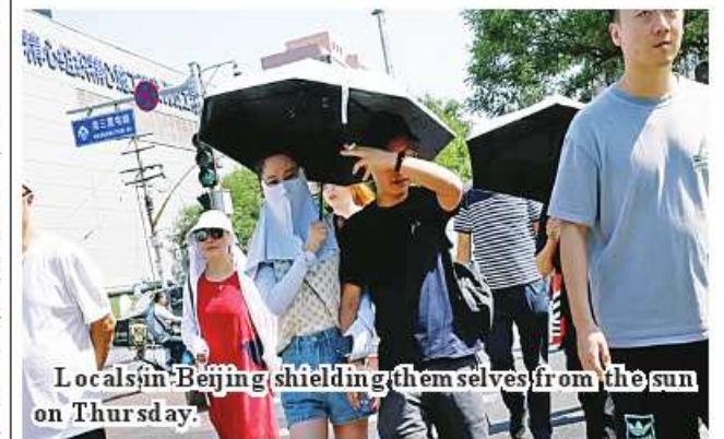
Locals in Beijing shielding themselves from the sun on Thursday.

Beijing June 22 Beijing has recorded its hottest June day in more than 60 years with the mercury touching 41.1C (105.9F), Chinese weather authorities say.