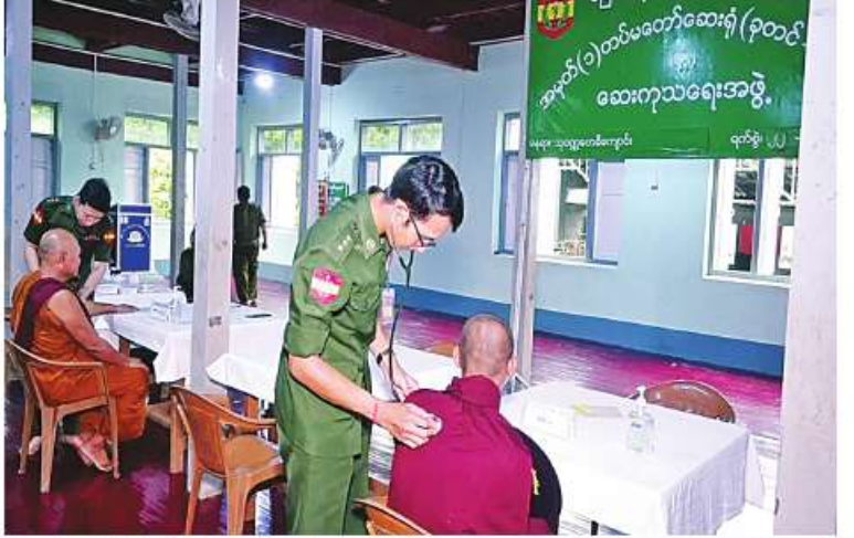
မြောက်ပိုင်းတိုင်းစစ်ဌာနချုပ် နယ်လှည့်ဆေးကုသရေးအဖွဲ့က သံဃာတော်များကို ကျန်းမာရေးစောင့်ရှောက်မှုလုပ်ငန်းများ ဆောင်ရွက်ပေးစဉ်။

နေပြည်တော် ၅.၆.၂၂ ကချင်ပြည်နယ် မြစ်ကြီးနားမြို့ပေါ်ရှိ သံဃာတော်များကို ယနေ့နံနက်ပိုင်းတွင် မြောက်ပိုင်းတိုင်းစစ်ဌာနချုပ် နယ်လှည့် ဆေးကုသရေးအဖွဲ့က အဆိုပါမြို့ရှိ သုဝဏ္ဏ တေမိရွှေညောင်ပင် ဘုန်းတော်ကြီးကျောင်း ဝင်းအတွင်း၌ ကျန်းမာရေးစောင့်ရှောက်မှု လုပ်ငန်းများ ဆောင်ရွက်ပေးသည်။ ထိုသို့ဆောင်ရွက်ပေးရာတွင် ခွဲစိတ် ကုသမှုဆိုင်ရာရောဂါ၊ အရိုးအကြောရောဂါ၊ အာရုံကြောအားနည်းရောဂါ၊ အထွေထွေ ရောဂါတို့နှင့်ပတ်သက်၍ သံဃာတော် ၅၁ ပါးတို့ကို လိုအပ်သည့်ကျန်းမာရေးစစ်ဆေး ကုသပေးခြင်း၊ ECG စက်ဖြင့် နှလုံးစမ်းသပ် စစ်ဆေးပေးခြင်းနှင့် ဓာတ်မှန်ရိုက်ကူး၍ ရောဂါရှာဖွေခြင်းများ ဆောင်ရွက်ပေးလျက် ရှိသည်။ ယင်းသို့ ဆောင်ရွက်ပေးနေမှုများကို တိုင်းစစ်ဌာနချုပ်မှ ဒုတိယတိုင်းမှူး ဗိုလ်မှူးချုပ် အောင်မျိုးဦးနှင့် တာဝန်ရှိသူ များက သွားရောက်ကြည့်ရှုကြည့်ညှိပြီး လိုအပ်သည်များ ညှိနှိုင်းဆောင်ရွက်ပေး ကာ သံဃာတော်များအား လှူဖွယ်ပစ္စည်း များနှင့် နေ့ဆွမ်းများ ဆက်ကပ်လှူဒါန်းခဲ့ ကြောင်း သတင်းရရှိသည်။