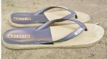
လယ်ဝေးမြို့မရဲစခန်းနှင့် MICC-II ဂိတ်(၂)ဝင်ထွက်ပေါက်ကို လက်ပစ်ခဲဖြင့် ပစ်ခတ်သည့်ဖြစ်စဉ်မှ တရားခံဝတ်ဆင်ခဲ့သည့် သက်သေခံပစ္စည်းများ မှတ်တမ်းဓာတ်ပုံ။