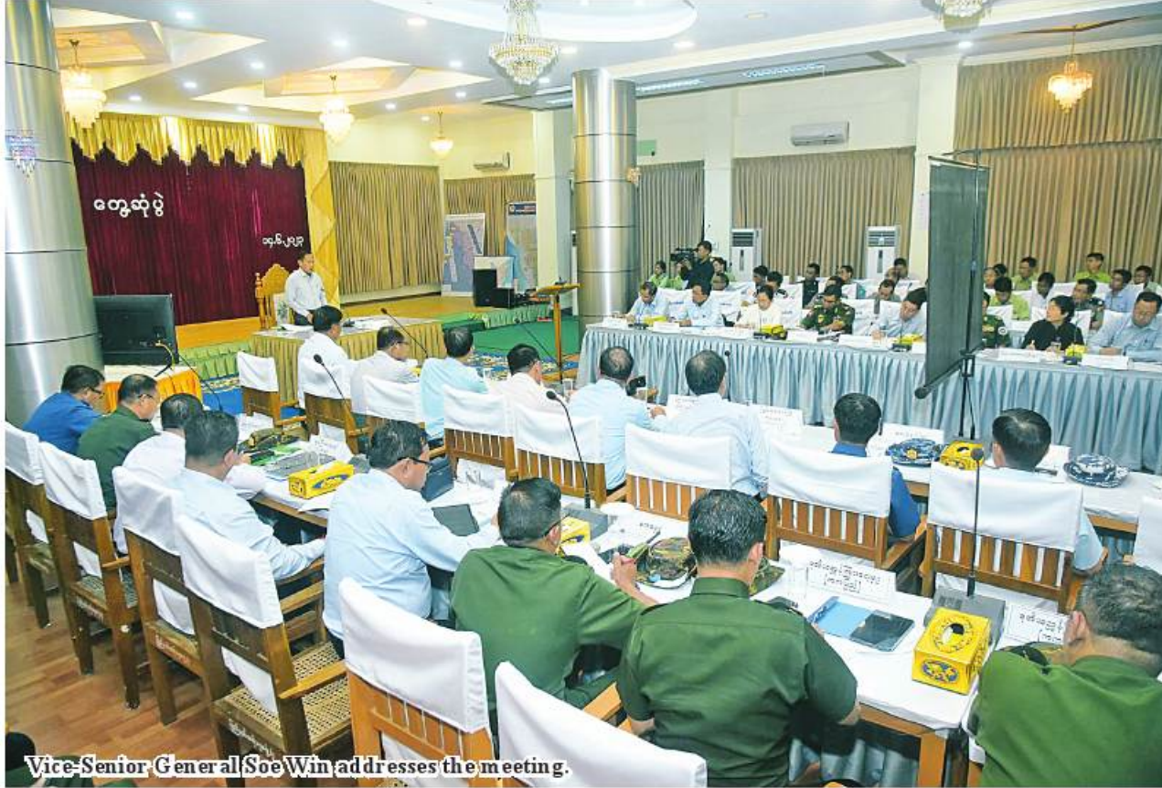
Vice-Senior General Soe Win addresses the meeting.