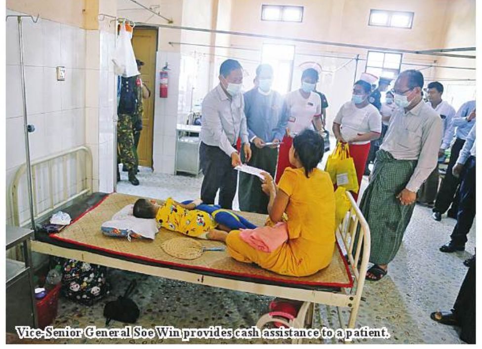
Vice-Senior General Soe Win provides cash assistance to a patient.