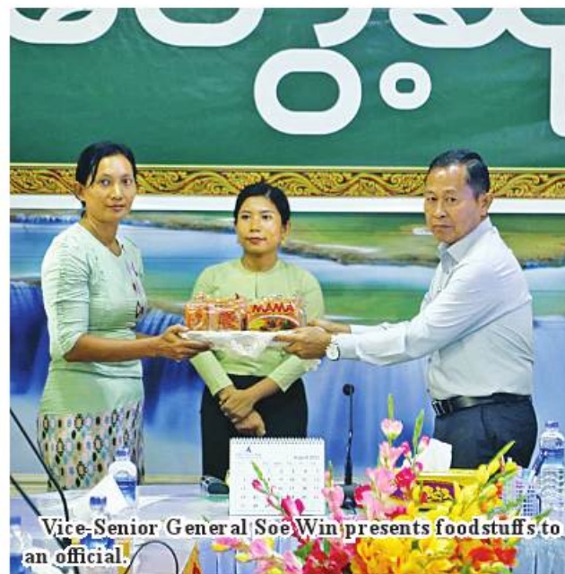
Vice-Senior General Soe Win presents foodstuffs to an official.