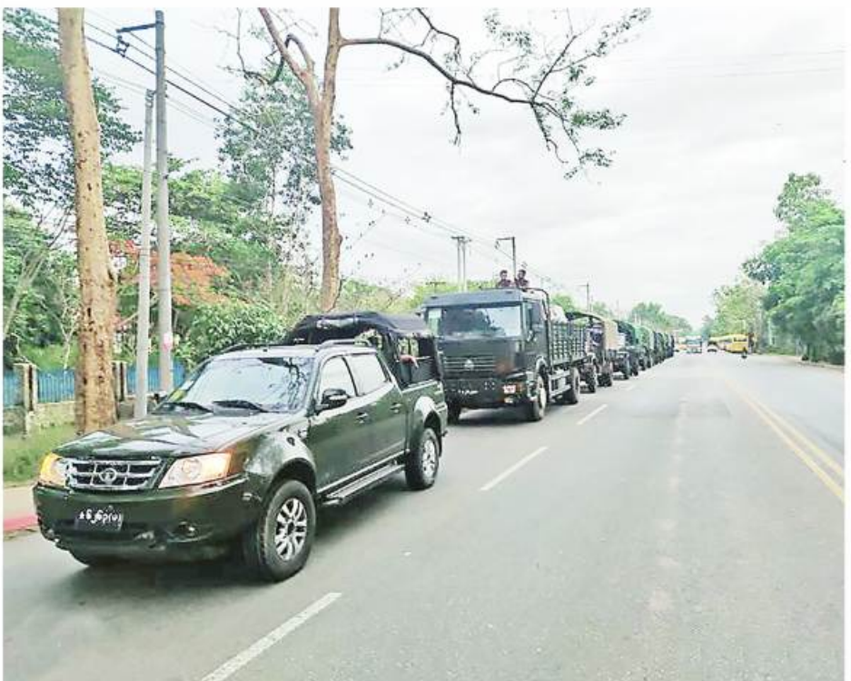
တပ်မတော်မှ ရွှေ့ပြေးကူညီကယ်ဆယ်ရေးယာဉ်အုပ်စုများ ထွက်ခွာစဉ်။