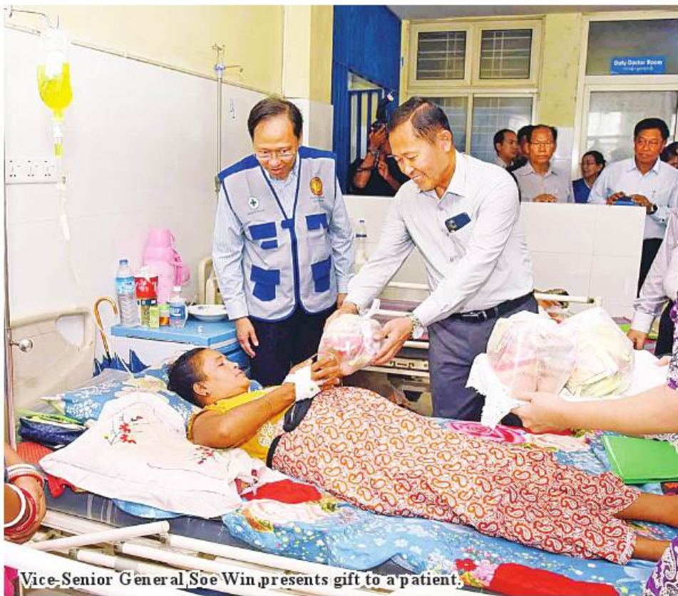
Vice-Senior General Soe Win presents gift to a patient.

In the health sector, the policy that nothing is important than life period has been implemented since the Covid-19 infection. Priority is being given to make