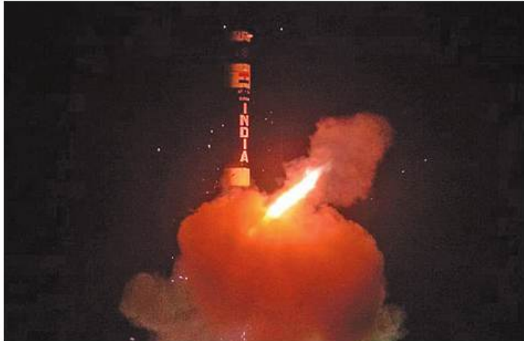
အိန္ဒိယနိုင်ငံသည် ၎င်း၏မျိုးဆက်သစ် အသုံးပြုနိုင်တော့မည်ဖြစ်ကြောင်း www.ကျွန်းပျံလီးယားပွဲထိန်းခုံးကျည်ကို အောင်မြင်စွာစမ်းသပ်နိုင်ခဲ့ပြီး တပ်တော်ဝင် ဇွန် ၁၂ ရက်တွင် ရေးသားဖော်ပြခဲ့သည်။

Agni Prime ၏ ပထမဆုံးတပ်တော် မဝင်မီ ညအချိန် စမ်းသပ်ပစ်လွှတ်ခဲ့မှုသည် မျိုးဆက်သစ်ပွဲထိန်းခုံးကျည်ဖွံ့ဖြိုးတိုးတက်မှုအတွက် စမ်းသပ်မှုများကို ပြုလုပ်နိုင်ခဲ့ပြီးနောက် တိကျမှုနှင့် ယုံကြည်စိတ်ချရမှုကို ထပ်မံသက်သေပြနိုင်ခဲ့ခြင်းဖြစ်ကြောင်း အိန္ဒိယနိုင်ငံ ကာကွယ်ရေးဝန်ကြီးဌာနက ထုတ်ပြန်ချက်တွင် ရေးသားထားသည်။ ရေဒါ၊ တယ်လီမီတာ၊ Electrooptical ခြေရာခံစနစ်များနှင့် တိုင်းတာရေးသင်္ဘောနှစ်စီးအပါအဝင် အကွာအဝေးတိုင်းတာရေးအတွက် ခုံးကျည်ပစ်လွှတ်သည့် နေရာနှင့် ပစ်မှတ်ကြား မတူညီသောနေရာများတွင်ဖြန့်ဖြူးကြက်ချထားပြီး ခုံးကျည်၏ လမ်းကြောင်းတစ်ခုလုံးကို လွှမ်းခြုံ၍ ပျံသန်းမှုအချက်အလက်များကို ဖမ်းယူသိရှိနိုင်