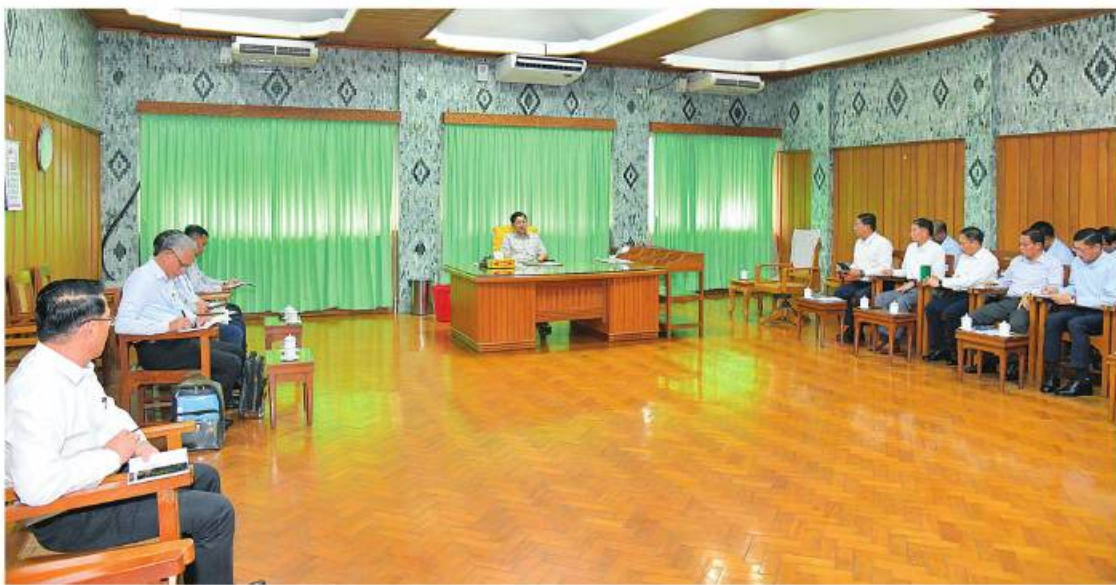
၂၀၂၃ ခုနှစ် မေ ၁၄ ရက်တွင် နိုင်ငံတော်စီမံအုပ်ချုပ်ရေးကောင်စီဥက္ကဋ္ဌ နိုင်ငံတော်ဝန်ကြီးချုပ် ဗိုလ်ချုပ်မှူးကြီး မင်းအောင်လှိုင် ဦးဆောင်၍ သဘာဝဘေးအန္တရာယ်ဆိုင်ရာစီမံခန့်ခွဲရေးအတွက် အရေးပေါ်အစည်းအဝေးကျင်းပပြုလုပ်စဉ်။

၂၀၂၃ ခုနှစ် မေလ ၂ ရက်မှာတော့ ဘင်္ဂလားပင်လယ်အော်နှင့် ကပ္ပလီ ပင်လယ်တို့မှာ လေဖိအားနည်း ရပ်ဝန်း တစ်ခု စတင်ဖြစ်ပေါ်လာခဲ့ပါတယ်။ လေဖိအားနည်းရပ်ဝန်းအဖြစ် စတင်ချိန် ကပင် မိုးလေဝသနှင့်ဇလဗေဒညွှန်ကြားမှု ဦးစီးဌာနက သတင်းထုတ်ပြန်ချက်များ ထုတ်ပြန်ပေးခဲ့ပါတယ်။