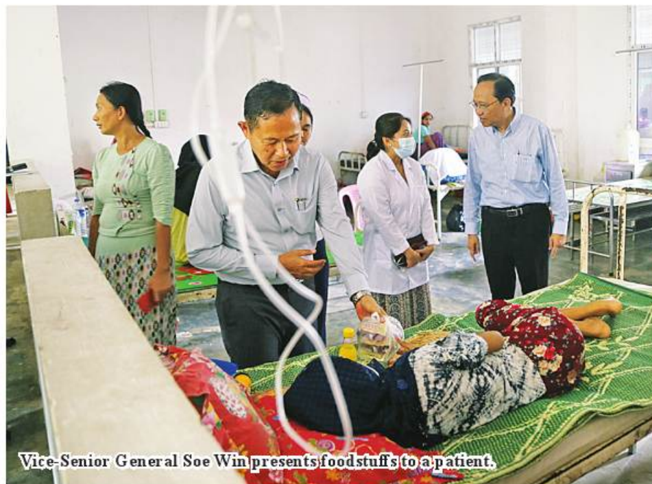
Vice-Senior General Soe Win presents foodstuffs to a patient.