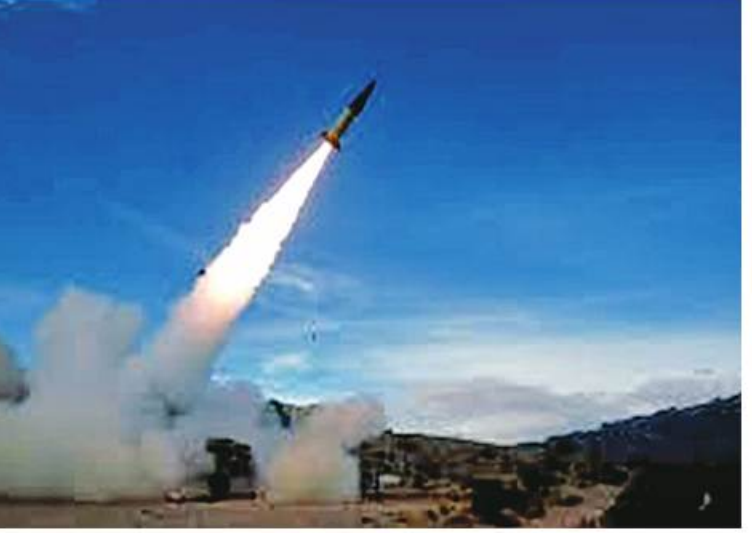
ပစ်ခုံးကျည်များ ပေးအပ်မှုမပြုဟု သမ္မတဘိုင်ဒင်က ငြင်းဆိုခဲ့သည့်အတွက် ယခုကဲ့သို့ တိုက်တွန်းလာခဲ့ခြင်းလည်းဖြစ်သည်။ US Lawmakers Urge Biden to Send Longer-Range Missiles to Ukraine ကို အသုံးပြုနိုင်အောင်ပါသည်။

အားတစ်ရပ် ပိုမိုဆိုးရွားလာမည်ကို ကြောက်ရွံ့မှုအားချေဖျက်ရန် ကြိုးပမ်းရာတွင် ယူကရိန်းနိုင်ငံကို Storm Shadow ခရုတ်ခုံးကျည်များပေးပို့ခြင်း၏ နမူနာကို ထောက်ပြခဲ့ပြီး ၎င်းခရုတ်ခုံးကျည်များ သုံး၍ ရုရှားနိုင်ငံအတွင်း ပစ်မှတ်များအပေါ် တိုက်ခိုက်လာနိုင်မှုအလားအလာကို ကိုးကားဖော်ပြခဲ့သေးသည်။ “ယူကရိန်းက သူ့ရဲ့ Storm Shadow ခုံးကျည်တွေကို ယူကရိန်းပိုင်နက်မှာ ရုရှားတပ်တွေကို တိုက်ခိုက်ပို့ပဲ အသုံးပြုမယ်လို့ ယူကရိန်းအရာရှိတွေရဲ့အာမခံချက်တွေနဲ့ အစီရင်ခံစာတင်ပြထားတာကြောင့် Storm Shadow ခုံးကျည်တွေ ယူကရိန်းထံပေးပို့တာကို ကျွန်ုပ်တို့အားပေးပါတယ်” ဟု အဆိုပါအစီရင်ခံစာတွင် ဖော်ပြထားသည်။ ယူကရိန်းသို့ အမေရိကန်ထုတ်တာဝေး