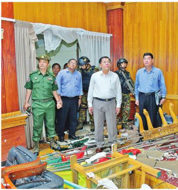
၂၀၂၃ ခုနှစ် မေ ၁၅ ရက်တွင် နိုင်ငံတော်စီမံအုပ်ချုပ်ရေးကောင်စီဥက္ကဋ္ဌ နိုင်ငံတော်ဝန်ကြီးချုပ် ဗိုလ်ချုပ်မှူးကြီး မင်းအောင်လှိုင် ဆိုင်ကလုန်းမုန်တိုင်း “မိုခါ” ဝင်ရောက် တိုက်ခတ်မှုကြောင့် ပျက်စီးဆုံးရှုံးမှုအခြေအနေများကို လိုက်လံကြည့်ရှုစစ်ဆေးစဉ်။

တကယ်တကယ်တမ်း ပြန်ကြည့် ရင် မြန်မာနိုင်ငံကို မုန်တိုင်းစတင် ဝင်ရောက်ချိန်ကနေ မြန်မာနိုင်ငံမှ မုန်တိုင်းထွက်ခွာသွားချိန်က နာရီပေါင်း