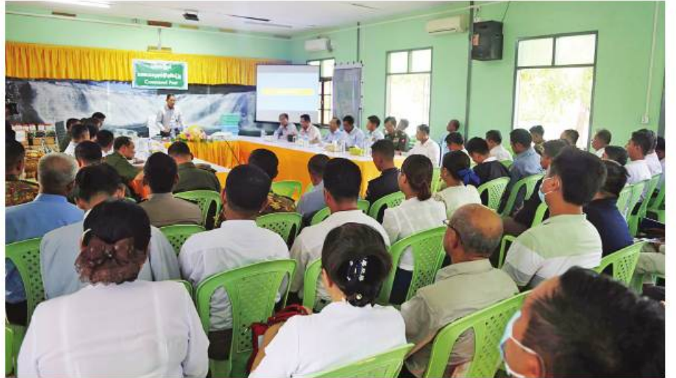
အမျိုးသားသဘာဝဘေးအန္တရာယ်ဆိုင်ရာစီမံခန့်ခွဲမှုကော်မတီဥက္ကဋ္ဌ နိုင်ငံတော်စီမံအုပ်ချုပ်ရေးကောင်စီ ဒုတိယဥက္ကဋ္ဌ ဒုတိယဝန်ကြီးချုပ် ဒုတိယဗိုလ်ချုပ်မှူးကြီးစိုးဝင်း ဘူးသီးတောင်မြို့နယ်ရှိ ဌာနဆိုင်ရာ ဝန်ထမ်းများ၊ ကူညီကယ်ဆယ်ရေးအဖွဲ့များနှင့် ပရဟိတအဖွဲ့များအား တွေ့ဆုံအမှာစကားပြောကြားစဉ်။