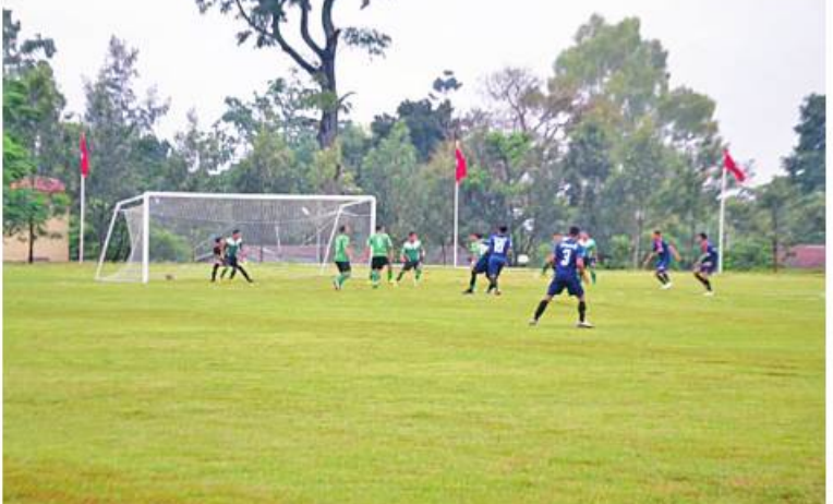
အရှေ့ပိုင်းတိုင်းစစ်ဌာနချုပ် တိုင်းမှူးခိုင်း ဘောလုံးပြိုင်ပွဲ အဖွင့်ပွဲစဉ်ယှဉ်ပြိုင်ကစားနေမှုကို တွေ့ရစဉ်။

တက်ရောက်လာကြသူများက အဖွင့်ပွဲစဉ် ဖြစ်သည့် အမှတ်(၅၅)ခြေမြန်တပ်မဌာနချုပ်အသင်းနှင့် တောင်ကြီးတပ်နယ် နယ်မြေ-၂အသင်းတို့၏ ယှဉ်ပြိုင်ကစားမှုများကို ကြည့်ရှုအားပေးကြသည်။ အဆိုပါ တိုင်းမှူးခိုင်းဘောလုံးပြိုင်ပွဲကို တိုင်းစစ်ဌာနချုပ် ကွပ်ကဲမှုအောက် တပ်ရင်းတပ်ဖွဲ့များမှ ပြိုင်ပွဲဝင်အသင်း ကိုးသင်းဖြင့် ဇူလိုင် ၂၅ ရက်ထိ ကျင်းပ သွားမည်ဖြစ်ကြောင်း သတင်းရရှိသည်။