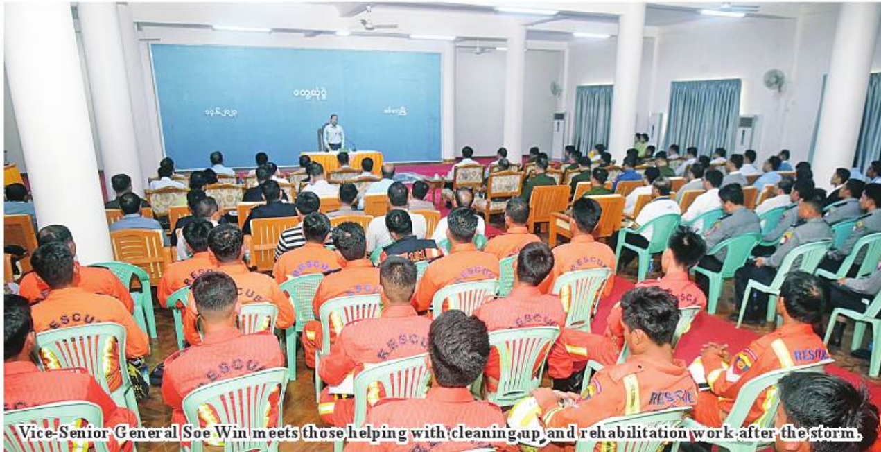
Vice-Senior General Soe Win meets those helping with cleaning up and rehabilitation work after the storm.