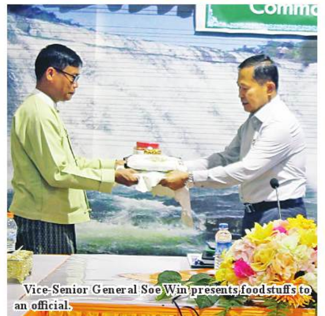
Vice-Senior General Soe Win presents foodstuffs to an official.