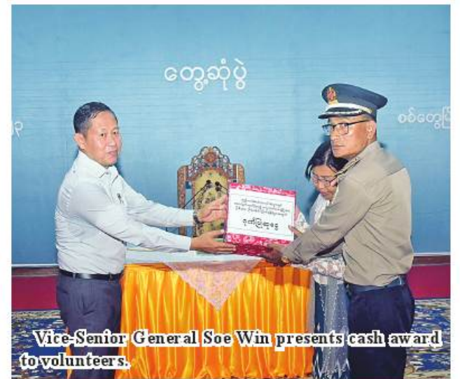
Vice-Senior General Soe Win presents cash award to volunteers.

The Vice-Senior General expressed his thanks to all