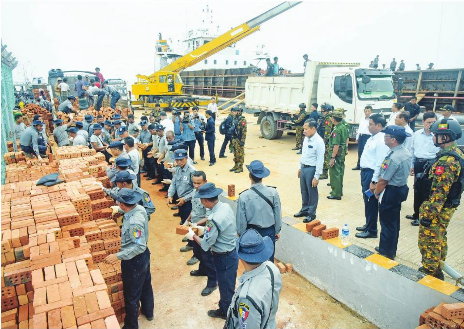
နေပြည်တော် ဇွန် ၁၄

ရခိုင်ပြည်နယ် စစ်တွေမြို့နယ်အတွင်း ကူညီကယ်ဆယ်ရေးနှင့် ပြန်လည်ထူထောင်ရေးလုပ်ငန်းများဆောင်ရွက်နေမှုအခြေအနေများကို ကြည့်ရှုစစ်ဆေး၊ ရွပ်ရွပ်ချွံချွင်းလင်းလုပ်အားပေးဆောင်ရွက်ခဲ့ကြသည့် ဌာနဆိုင်ရာဝန်ထမ်းများ၊ ကူညီကယ်ဆယ်ရေးအဖွဲ့များနှင့် ပရဟိတအဖွဲ့များကို တွေ့ဆုံရည်ပြုအမှာစကားပြောကြား