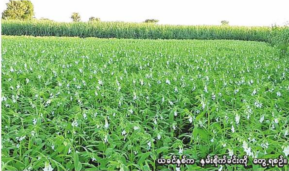
ယခင်နှစ်က မိုးသီးနှံစိုက်ပျိုးရာသီ၌ တွေ့ရစဉ်။

မုံရွာ ဇွန် ၁၄ စစ်ကိုင်းတိုင်းဒေသကြီးတွင် ယခုနှစ် မိုးသီးနှံစိုက်ပျိုးရာသီ၌ မိုးနှမ်း ၄၂၉၄၇၂ ဧကစိုက်ပျိုးမည် ဖြစ်ကြောင်း စစ်ကိုင်းတိုင်းဒေသကြီး စိုက်ပျိုးရေးဦးစီးဌာနမှ သိရသည်။ ယခုနှစ် မိုးသီးနှံစိုက်ပျိုးရာသီ၌ စစ်ကိုင်းတိုင်းဒေသကြီးတွင် မိုးနှမ်းစိုက်ပျိုးရန်အတွက် ခရိုင်အလိုက်လျာထားမှုအနေဖြင့် မော်လိုက်ခရိုင်တွင် ၈၀၊ ကလေးခရိုင်တွင် ၄၇၀၃၃ ဧက၊ ခန္တီးခရိုင်