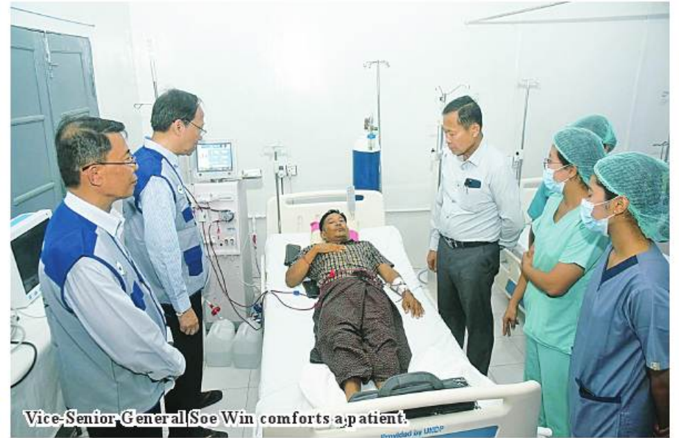
Vice-Senior General Soe Win comforts a patient.