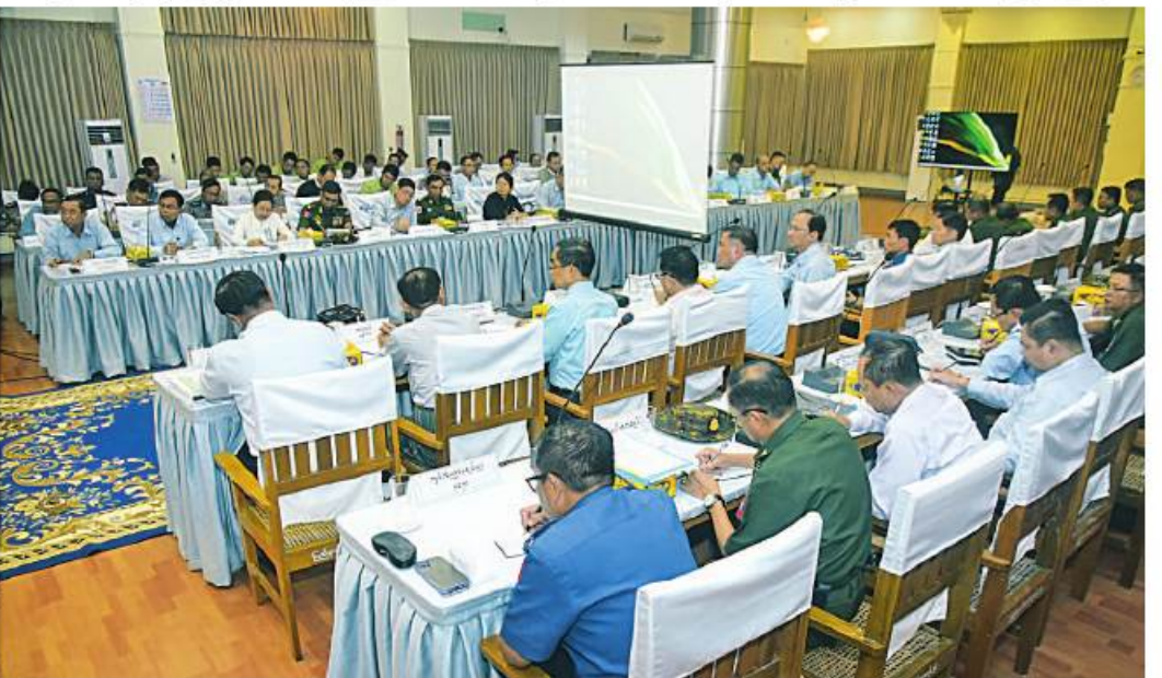
အမျိုးသားသဘာဝဘေးအန္တရာယ်ဆိုင်ရာ စီမံခန့်ခွဲမှုကော်မတီဥက္ကဋ္ဌ နိုင်ငံတော်စီမံအုပ်ချုပ်ရေးကောင်စီ ဒုတိယဥက္ကဋ္ဌ ဒုတိယဝန်ကြီးချုပ် ဒုတိယဝန်ကြီးချုပ်မှူးကြီးစိုးဝင်း ရခိုင်ပြည်နယ် သဘာဝဘေးပြန်လည်ထူထောင်ရေးဆိုင်ရာ လုပ်ငန်းညှိနှိုင်းအစည်းအဝေးတွင် အမှာစကားပြောကြားစဉ်။