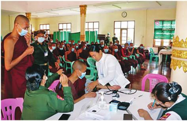
သံဃာတော်များအား အလယ်ပိုင်းတိုင်းစစ်ဌာနချုပ် နယ်မြေခံဆေးကုသရေးအဖွဲ့က ကျန်းမာရေးစောင့်ရှောက်မှုလုပ်ငန်းများ ဆောင်ရွက်ပေးခဲ့ပါ။

နေပြည်တော် ၅ ဇူလိုင် ၂၀၂၃ ရန်ကင်းတိုင်းဒေသကြီး ကျောက်တန်းမြို့နယ် ပါဠိကြီးကျေးရွာနှင့် ပတ်ဝန်းကျင်ကျေးရွာများမှ ဒေသခံပြည်သူများဆိပ်ကြီးခရိုင်တိုင်းမြို့နယ် ခရိုင်တိုင်းအရှေ့ရပ်ကွက်တို့မှ သံဃာတော်များ၊ သာသနာ့ဦးစီးဌာနမှ ဒေသခံပြည်သူများကို ယနေ့နံနက်ပိုင်းတွင် ရန်ကင်းတိုင်းစစ်ဌာနချုပ် နယ်လှည့်ဆေးကုသရေးအဖွဲ့က ပါဠိကြီးကျေးရွာမှစ၍ ခရိုင်တိုင်းအရှေ့ရပ်ကွက်ရှိ ဓမ္မပိတကျောင်းတိုက်တို့