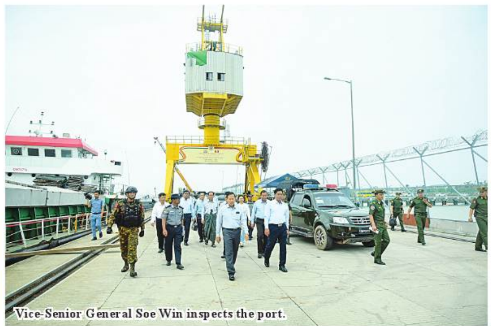
Vice-Senior General Soe Win inspects the port.

courses and observed the work of volunteers.