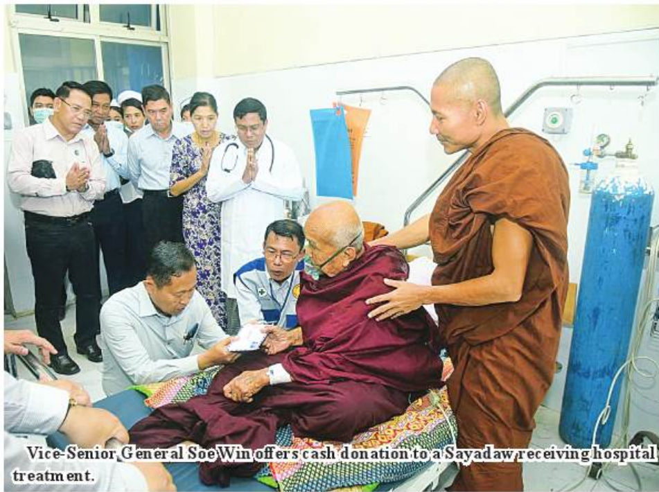
Vice-Senior General Soe Win offers cash donation to a Sayadaw receiving hospital treatment.