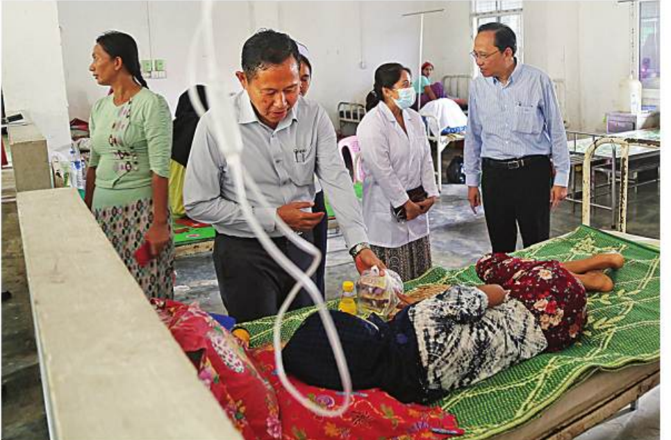
အမျိုးသားသဘာဝဘေးအန္တရာယ်ဆိုင်ရာစီမံခန့်ခွဲမှုကော်မတီဥက္ကဋ္ဌ နိုင်ငံတော်စီမံအုပ်ချုပ်ရေးကောင်စီဒုတိယဥက္ကဋ္ဌ ဒုတိယဝန်ကြီးချုပ် ဒုတိယဗိုလ်ချုပ်မှူးကြီးစိုးဝင်း မောင်တောမြို့နယ်ရှိ ပြည်သူ့ဆေးရုံ၌ ဆေးကုသမှုခံယူလျက်ရှိသည့်လူနာများကို လိုက်လံကြည့်ရှုအေးပေးစကားပြောကြားခြင်း။