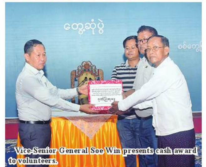
Vice-Senior General Soe Win presents cash award to volunteers.