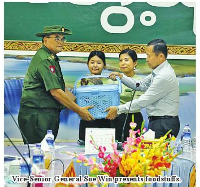
Vice-Senior General Soe Win presents foodstuffs.

lice force members and their families in the two townships. After hearing reports, the Vice-Senior General coordinated necessary matters and presented foodstuffs and cash awards. 100