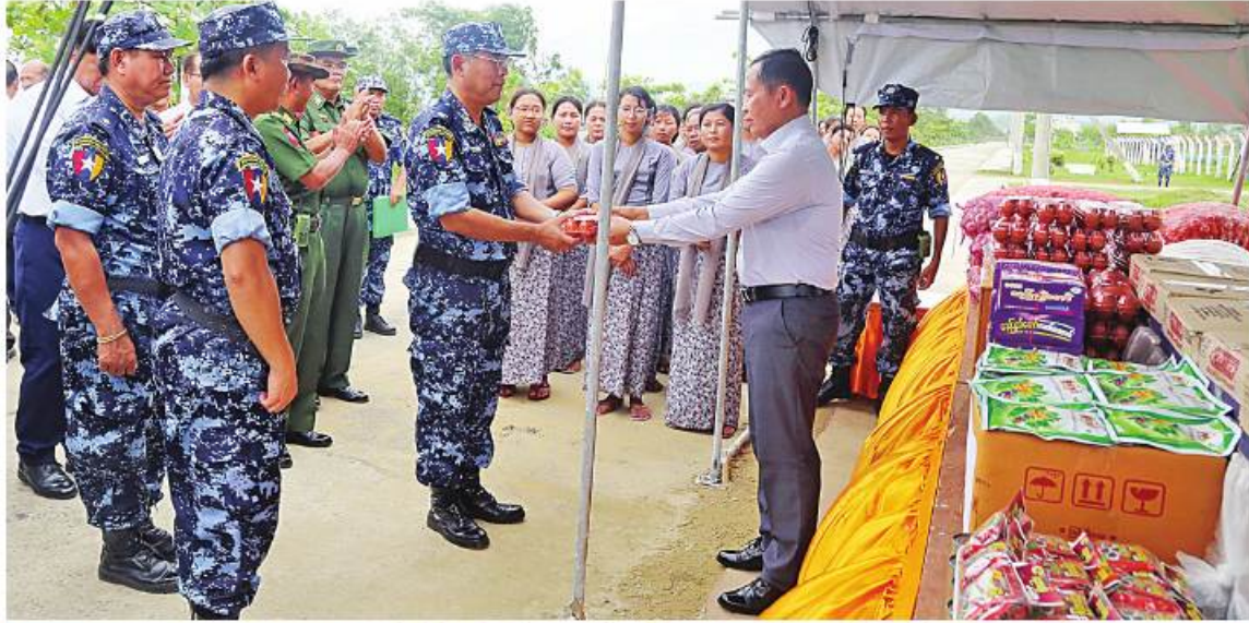
အမျိုးသားသဘာဝဘေးအန္တရာယ်ဆိုင်ရာစီမံခန့်ခွဲမှုကော်မတီဥက္ကဋ္ဌ နိုင်ငံတော်စီမံအုပ်ချုပ်ရေးကောင်စီ ဒုတိယဥက္ကဋ္ဌ ဒုတိယဝန်ကြီးချုပ် ဒုတိယဗိုလ်ချုပ်မှူးကြီးစိုးဝင်း မောင်တောမြို့နယ်ရှိ နယ်ခြားစောင့်ရဲတပ်ဖွဲ့ဝင်များနှင့် မိသားစုများအတွက် စားသောက်ဖွယ်ရာများနှင့် ဂုဏ်ပြုချီးမြှင့်ငွေများပေးအပ်ခဲ့ခြင်း။

ရွက်ပေးသည်။ ထို့နောက် နိုင်ငံတော်စီမံအုပ်ချုပ်ရေးကောင်စီဒုတိယဥက္ကဋ္ဌ ဒုတိယဝန်ကြီးချုပ်က မိုခါမုန်တိုင်းအလွန် ပြန်လည်ထူထောင်ရေးအတွက် Disaster Management Centre-DMC ၏ ဆောင်ရွက်နေမှုအခြေအနေများ၊ ပညာရေး၊ ကျန်းမာရေး၊ သာသနာဆိုင်ရာ အဆောက်အအုံများ၊ ရုံး၊ ဌာနဆိုင်ရာ အဆောက်အအုံများအလိုက် ဦးစားပေးဆောင်ရွက်နေမှုအခြေအနေများ၊ ပြည်သူများအားလုံး အမိုးအကာအောက်ရောက်ရှိရေးဦးစားပေးဆောင်ရွက်နေသည့် အခြေအနေများ၊ မိုးရာသီတွင် စိုက်ပျိုးရေးအတွက် ထွန်ယက်မှုနှင့် မျိုးစေ့လိုအပ်မှုအတွက် စီမံဆောင်ရွက်ပေးမှုအခြေအနေများ၊ ငွန် ၁ ရက်အမီ ကျောင်းဖွင့်လှစ်နိုင်ရေးနှင့် ကျောင်းများပြုပြင်နေဆဲကာလအတွင်း ၉၉ ရာခိုင်နှုန်းပြီးစီးခဲ့မှုအခြေအနေများ၊ အခြေခံလူတန်းစား စားဝတ်နေရေး ပြေလည်စေရေး မုန်တိုင်းမတိုက်ခတ်မီ အရန်ဆန်တန်ခိုခို ၁၀၀၀၀(အိတ် ၂၀၀၀၀) စုဆောင်းခဲ့မှုအခြေအနေများ၊ ညီညွတ်မှုနှင့် ပူးပေါင်းဆောင်ရွက်မှုတို့ဖြင့် အမြန်ဆုံး ပြန်လည်ထူထောင်ရေးလုပ်ငန်းများဆောင်ရွက်နိုင်ခဲ့သည် အစဉ်အလာကောင်းကို ဆက်လက်ထိန်းသိမ်းရန် လိုအပ်သည့် အခြေအနေများကို အသေးစိတ်ဆွေးနွေးရှင်းလင်းပြောကြားပြီး တက်ရောက်လာကြသူများ၏တင်ပြချက်များအပေါ် လိုအပ်သည်များပေါင်းစပ်ညှိနှိုင်းဆောင်ရွက်ပေးသည်။ ထို့နောက်ဌာနဆိုင်ရာများ၊ ကူညီကယ်ဆယ်ရေးအဖွဲ့များနှင့် ပရဟိတအဖွဲ့များကို စားသောက်ဖွယ်ရာများ ထောက်ပံ့ပေးအပ်သည်။