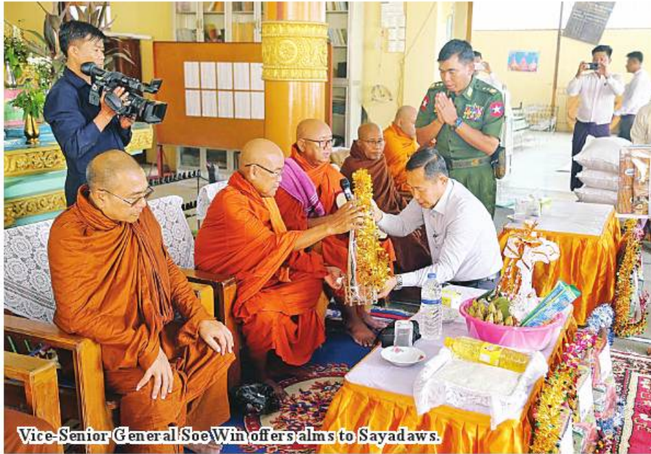
Vice-Senior General Soe Win offers alms to Sayadaws.

Nay Pyi Taw June 14 Chairman of the National Natural Disaster Management Committee Vice Chairman of the State Administration Council Deputy Prime Minister Vice-Senior General Soe Win, who is currently in Sittway, and his entourage inspected rehabilitation work in Maungtaw and Buthitaung townships this afternoon, and separately met with departmental staff, rescue and relief teams and charity organizations at the district/township general administration offices.