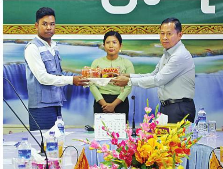
အမျိုးသားသဘာဝဘေးအန္တရာယ်ဆိုင်ရာစီမံခန့်ခွဲမှုကော်မတီဥက္ကဋ္ဌ နိုင်ငံတော်စီမံအုပ်ချုပ်ရေးကောင်စီဒုတိယဥက္ကဋ္ဌ ဒုတိယဝန်ကြီးချုပ် ဒုတိယဗိုလ်ချုပ်မှူးကြီးစိုးဝင်း မောင်တောမြို့နယ်ရှိ ဌာနဆိုင်ရာဝန်ထမ်းများ၊ ကူညီကယ်ဆယ်ရေးအဖွဲ့များနှင့် ပရဟိတအဖွဲ့များအား စားသောက်ဖွယ်ရာများ ထောက်ပံ့ပေးအပ်ခြင်း။

နေပြည်တော် ၅.၆.၂၃ စစ်တွေမြို့သို့ ရောက်ရှိနေသော အမျိုးသားသဘာဝဘေးအန္တရာယ်ဆိုင်ရာစီမံခန့်ခွဲမှုကော်မတီဥက္ကဋ္ဌ နိုင်ငံတော်စီမံအုပ်ချုပ်ရေးကောင်စီဒုတိယဥက္ကဋ္ဌ ဒုတိယဝန်ကြီးချုပ် ဒုတိယဗိုလ်ချုပ်မှူးကြီးစိုးဝင်းသည် အဖွဲ့ဝင်များလိုက်ပါ၍ ယနေ့မုန်းလွဲပိုင်းတွင် မောင်တောမြို့နှင့်ဘူးသီးတောင်မြို့တို့သို့သွားရောက်၍ ပြန်လည်ထူထောင်ရေးလုပ်ငန်းများ ဆောင်ရွက်နေမှုများကို လိုက်လံကြည့်ရှုစစ်ဆေးပြီး ခရိုင်၊ မြို့နယ်အထွေထွေအုပ်ချုပ်ရေးမှူးရုံး အစည်းအဝေးခန်းမများ၌ဌာနဆိုင်ရာများ၊ ကူညီကယ်ဆယ်ရေးအဖွဲ့များနှင့် ပရဟိတအဖွဲ့များကို သီးခြားစီတွေ့ဆုံအမှာစကားပြောကြားသည်။ ဦးစွာ မောင်တောမြို့နှင့်ဘူးသီးတောင်မြို့တို့မှ ခရိုင်၊ မြို့နယ် စီမံအုပ်ချုပ်ရေးကောင်စီဥက္ကဋ္ဌများနှင့် ပြန်လည်ထူထောင်ရေးလုပ်ငန်းများတွင် ကြီးကြပ်ရန်တာဝန်ပေးအပ်ထားသည့် အရာရှိကြီးများက မုန်တိုင်းတိုက်ခတ်မှုကြောင့် ပျက်စီးဆုံးရှုံးမှုများနှင့် ပြန်လည်ထူထောင်ရေး၊ တည်ဆောက်ရေး