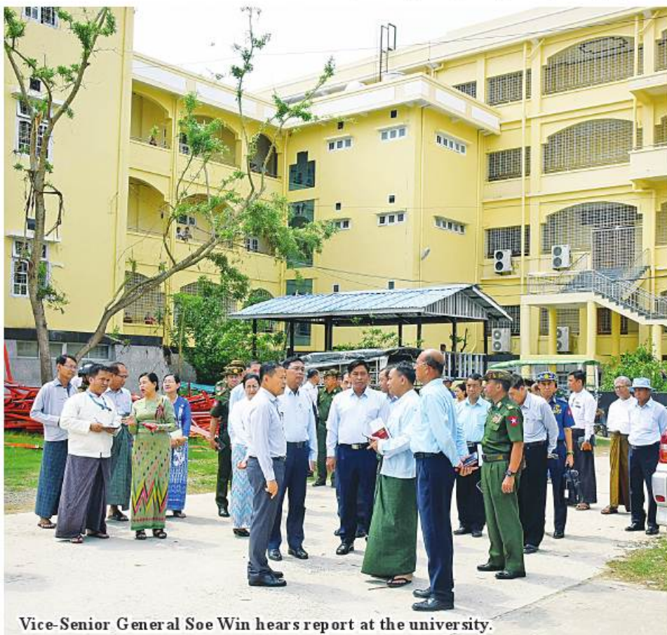
Vice-Senior General Soe Win hears report at the university.

At the Lawkananda Pagoda compound, the Vice-Senior General attended the ceremony to honour de-