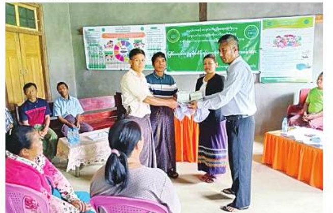
ကိုလိုင်

ကျေးရွာသားများကိုယ်တိုင် ယခုနှစ် ငွေလပထမပတ်ကစတင် ဆောင်ရွက်ခဲ့ရာ ယခုအခါ လုပ်ငန်းများ ၃၀ ရာခိုင်နှုန်းကျော် ပြီးစီးနေပြီဖြစ်ကြောင်း၊ အဆိုပါလုပ်ငန်း ဆောင်ရွက်ပြီးစီးပါက ရဲဘော်ဟောင်းကျေးရွာရှိ အိမ်ခြေ ၁၂၀၊ လူဦးရေ ၅၅၀ တို့၏ စီးပွားရေး၊ လူမှုရေး၊ ကျန်းမာရေး၊ ပညာရေးကိစ္စရပ်များအတွက် သွားလာရာတွင် ရာသီမရွေးသွားလာနိုင်မည် ဖြစ်ကြောင်း သိရသည်။