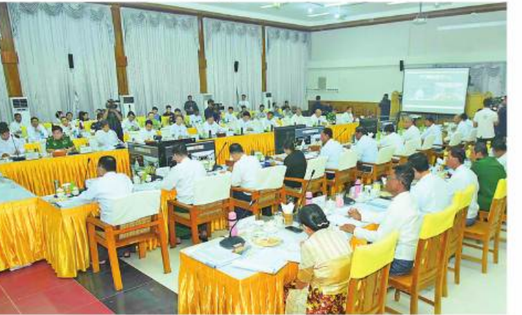
၂၀၂၃ ခုနှစ် မေ ၆ ရက်တွင် နိုင်ငံတော်စီမံအုပ်ချုပ်ရေးကောင်စီဒုတိယဥက္ကဋ္ဌ ဒုတိယဝန်ကြီးချုပ် ဒုတိယဗိုလ်ချုပ်မှူးကြီး စိုးဝင်း အမျိုးသားအဆင့်သဘာဝဘေးအန္တရာယ်ဆိုင်ရာစီမံခန့်ခွဲမှုကော်မတီ အရေးပေါ်လုပ်ငန်းညှိနှိုင်းအစည်းအဝေး ကျင်းပ ပြုလုပ်စဉ်။

မိုးလေဝသနှင့်ဇလဗေဒညွှန်ကြားမှု ဦးစီးဌာနက ၂၀၂၃ ခုနှစ် မေလ ၉ ရက် မြန်မာစံတော်ချိန် ၂၃၀၀ နာရီအချိန် ထုတ်ပြန်တဲ့ မုန်တိုင်းငယ်သတိပေးချက် (၁/၂၀၂၃) ကနေစပြီး သတိပေးချက်တွေ ကို ဆက်တိုက်ဆိုသလိုထုတ်ပြန်ခဲ့တာပါ။ ထုတ်ပြန်ချက်ထဲမှာတော့ ဘင်္ဂလား ပင်လယ်အော်အရှေ့တောင်ပိုင်းနှင့် ယင်း နှင့်ဆက်စပ်လျက်ရှိသော ကပ္ပလီ ပင်လယ်ပြင်တောင်ပိုင်းတို့တွင် ဖြစ်ပေါ် နေသော အားကောင်းသောလေဖိအား နည်းရပ်ဝန်း (Well Marked Low Pressure Area) သည် ပိုမိုအားကောင်း လာပြီး ဘင်္ဂလားပင်လယ်အော်အရှေ့ တောင်ပိုင်းတွင် မုန်တိုင်းငယ် (Depre-