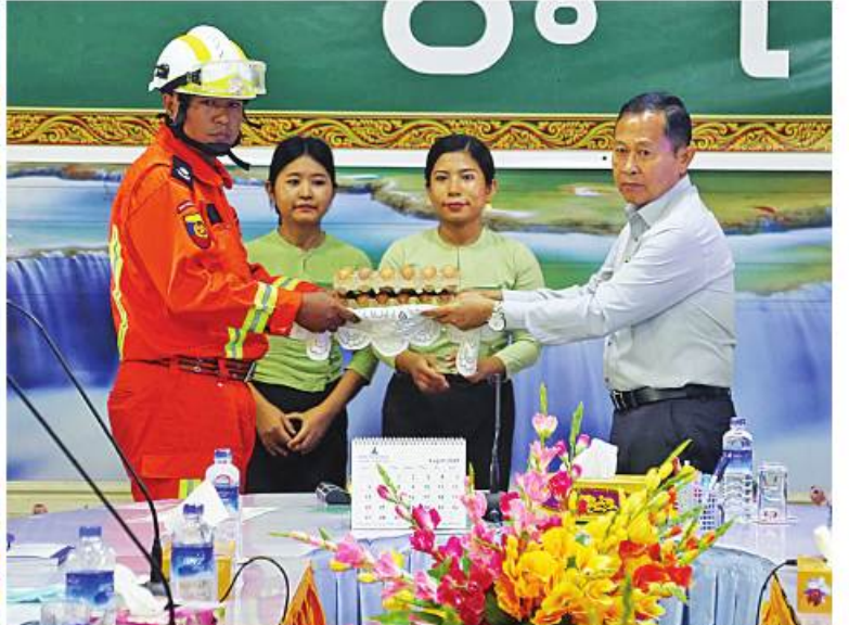
အမျိုးသားသဘာဝဘေးအန္တရာယ်ဆိုင်ရာစီမံခန့်ခွဲမှုကော်မတီဥက္ကဋ္ဌ နိုင်ငံတော်စီမံအုပ်ချုပ်ရေးကောင်စီဒုတိယဥက္ကဋ္ဌ ဒုတိယဝန်ကြီးချုပ် ဒုတိယဗိုလ်ချုပ်မှူးကြီးစိုးဝင်း မောင်တောမြို့နယ်ရှိ ဌာနဆိုင်ရာဝန်ထမ်းများ၊ ကူညီကယ်ဆယ်ရေးအဖွဲ့များနှင့် ပရဟိတအဖွဲ့များအား စားသောက်ဖွယ်ရာများ ထောက်ပံ့ပေးအပ်ခြင်း။

လုပ်ငန်းများ ဆောင်ရွက်နေမှုအခြေအနေများ၊ ပျက်စီးသွားသော အဆောက်အအုံများအတွက် ဆောက်လုပ်ရေးပစ္စည်းများဖြည့်ဆည်းပေးနေမှု၊ ရိက္ခာပြတ်လပ်မှုမရှိစေရေးစီမံထားရှိမှု၊ ပျက်စီးသွားသော ကျောင်းများအမြန်ပြန်လည်ပြင်ဆင်ဆောင်ရွက်နေမှုများကို အသီးသီးတင်ပြရာ နိုင်ငံတော်စီမံအုပ်ချုပ်ရေးကောင်စီဒုတိယဥက္ကဋ္ဌ ဒုတိယဝန်ကြီးချုပ်က လိုအပ်သည်များကို ပေါင်းစပ်ညှိနှိုင်းဖြည့်ဆည်းဆောင်ရွက်ပေးသည့်အပြင် ကျောင်းသား၊ ကျောင်းသူများ အမိုးအကာအောက်တွင် စာသင်ကြားနိုင်ရေးဆိုင်ရာစီမံဆောင်ရွက်ခဲ့မှုအခြေအနေများ၊ မြို့နယ်များအလိုက် ဆက်သွယ်မှုကောင်းမွန်ရန် ကြိုးပမ်းဆောင်ရွက်ခဲ့ရာ ရခိုင်ပြည်နယ်