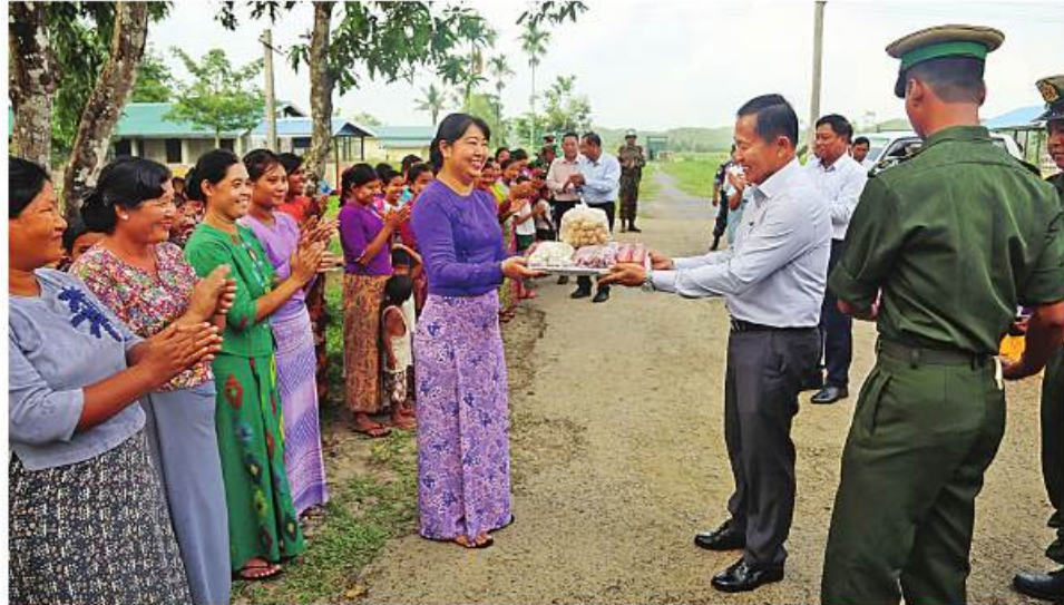
အမျိုးသားသဘာဝဘေးအန္တရာယ်ဆိုင်ရာစီမံခန့်ခွဲမှုကော်မတီဥက္ကဋ္ဌ နိုင်ငံတော်စီမံအုပ်ချုပ်ရေးကောင်စီ ဒုတိယဥက္ကဋ္ဌ ဒုတိယဝန်ကြီးချုပ် ဒုတိယဗိုလ်ချုပ်မှူးကြီးစိုးဝင်း ဘူးသီးတောင်မြို့နယ်ရှိ နယ်မြေခံတပ်ရင်းမှ အရာရှိ၊ စစ်သည်၊ မိသားစုများအတွက် စားသောက်ဖွယ်ရာများနှင့်ဂုဏ်ပြုချီးမြှင့်ငွေများ ပေးအပ်စဉ်။