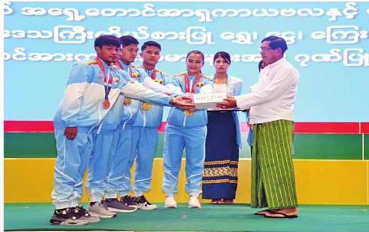
ရန်ကုန်တိုင်းဒေသကြီးဝန်ကြီးချုပ် ဦးစိုးသိန်း နိုင်ငံ့ဂုဏ်ဆောင် အားကစားသမားများကို ဂုဏ်ပြုချီးမြှင့်စဉ်။

နေပြည်တော် ၈ ဇွန် ၁၃ (၃၂)ကြိမ်မြောက် အရှေ့တောင်အာရှ အားကစားပြိုင်ပွဲ၊ (၁၂)ကြိမ်မြောက် အာဆီယံမသန်စွမ်းသူများအားကစားပြိုင်ပွဲ နှင့် (၁၇)ကြိမ်မြောက် အရှေ့တောင်အာရှ ကာယပလနှင့်ကာယကြံ့ခိုင်မှုပြိုင်ပွဲများတွင် နိုင်ငံကိုယ်စားပြု ပါဝင်ယှဉ်ပြိုင်ခဲ့ကြသည့် မွန်ပြည်နယ်နှင့် ရန်ကုန်တိုင်းဒေသကြီးတို့မှ