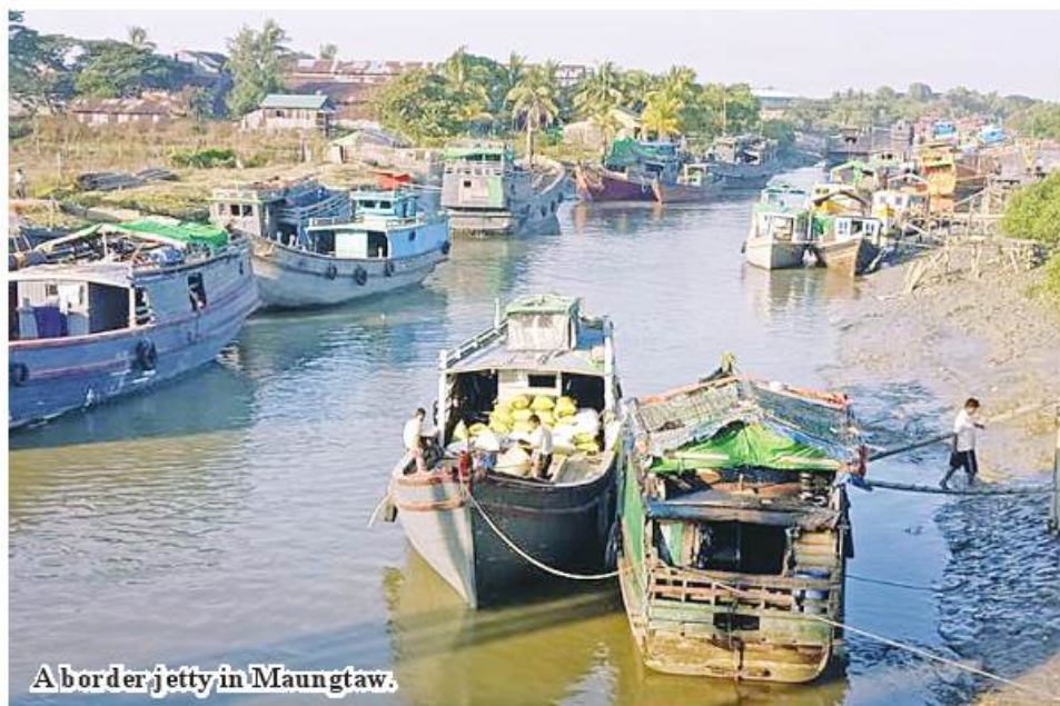
A border jetty in Maungtaw.

Maungtaw June 13 The Ministry of Commerce stated that Maungtaw border trade camp despite suffering impacts of cyclonic storm Mocha conducted trading against 35 per cent of the target with trade surplus. Maungtaw border trade camp in Rakhine State handles trading with Bangladesh. In May of 2023-24 financial year, the camp set a target to manage US$1.5 million worth of export and US$0.04 million worth of import. Unfortunately, due to