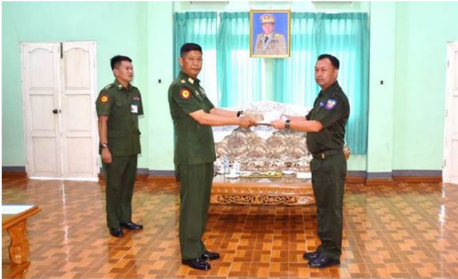
အရှေ့အလယ်ပိုင်းတိုင်း ဝန်ကြီးဌာနချုပ် တိုင်းမှူး ဝိုင်းချုပ်မျိုးမင်းထွန်း ရှမ်းပြည်နယ် (တောင်ပိုင်း) ခိုလှုံမြို့ရှိ ပြည်သူ့စစ်(ဌာနေ) တပ်ဖွဲ့ဝင်များကို စားသောက်ဖွယ်ရာများ ပေးအပ်ရာ တာဝန်ရှိသူတစ်ဦးက လက်ခံရယူစဉ်။

နေပြည်တော် ဇွန် ၁၃ - ပြည်သူ့စစ်(ဌာနေ) တပ်ဖွဲ့ဝင်များကို စစ်ဌာနချုပ် တိုင်းမှူး ဝိုင်းချုပ်မျိုးမင်းထွန်း ရှမ်းပြည်နယ်(တောင်ပိုင်း) ခိုလှုံမြို့ရှိ ယနေ့တွင် အရှေ့အလယ်ပိုင်းတိုင်း က တိုင်းစစ်ဌာနချုပ် ၁ ရေရိပ်သာ၌