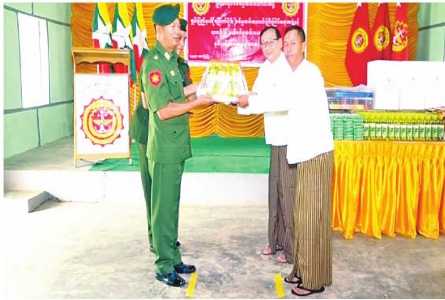
အရှေ့မြောက် တိုင်းစစ်ဌာနချုပ် တိုင်းမှူး ဗိုလ်ချုပ်ခင်နိုင်ဦး လားရှိုးမြို့ရှိ စစ်မှုထမ်းဟောင်း အဖွဲ့ဝင်များအတွက် လှူဒါန်းမှုပေးအပ်ခြင်း