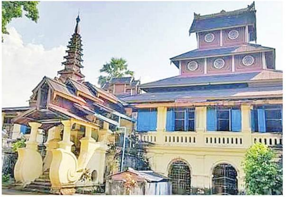
မော်လမြိုင်မြို့ရှိ ရတနာပုံမြင့်ကျောင်းခေါ် စိန်တုံးမိဖုရားကျောင်းကို တွေ့ရစဉ်။

ဝိသုကာပညာကိုတတ်ကျွမ်းသော ဝဇီရာရာမဆရာတော်နှင့် နန်းစလေတွင်ကျွမ်းဝင်သော စိန်တုံး