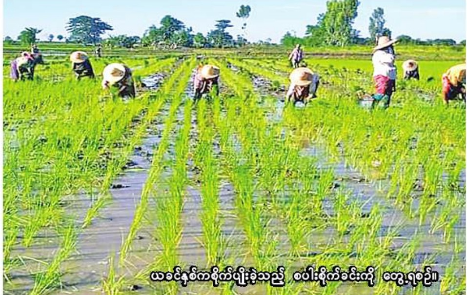
ယခင်နှစ်ကစိုက်ပျိုးခဲ့သည့် စပါးစိုက်ခင်းကို တွေ့ရစဉ်။