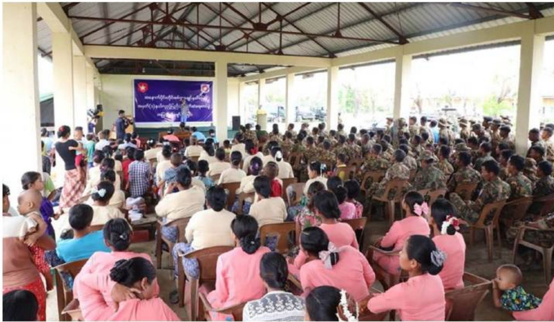
ရခိုင်ပြည်နယ်အတွင်း မိုခါမုန်တိုင်းသင့်ဒေသများတွင် ပြန်လည်ထူထောင်ရေးလုပ်ငန်းများ ဆောင်ရွက်လျက်ရှိသည့် နယ်မြေခံတပ်မတော်သားများ၊ မြန်မာနိုင်ငံရဲတပ်ဖွဲ့ဝင်များ၊ မီးသတ်တပ်ဖွဲ့ဝင်များနှင့် မိသားစုဝင်များကို နယ်လှည့်ပြည်သူ့ဆက်ဆံရေးတပ်ဖွဲ့မှ ကပြသီဆိုဖျော်ဖြေစဉ်။

နေပြည်တော် ၈ နံနက် ၁၃ စစ်သည်၊ စစ်သမီးများက မြန်မာသံစဉ် တေးသီချင်းများ၊ ခေတ်ပေါ်တေးသီချင်း အဆိုအကများ၊ တေးသရုပ်ဖော်အကများ၊ ရယ်ရွှင်ဖွယ်ရာဟာသပြဇာတ်၊ ဒေသ၏ ရိုးရာယဉ်ကျေးမှု အကအလှများ၊ ဗဟုသုတ ပြစ်ဖွယ်ရာ အသိပညာပေးအစီအစဉ်များဖြင့် ကာကွယ်ရေးဦးစီးချုပ်ရုံး(ကြည်း)မှ ဒုတိယ ဝိုင်းချုပ်ကြီးဖုန်းမြတ်၊ အနောက်ပိုင်းတိုင်း စစ်ဌာနချုပ် တိုင်းမှူး ဝိုင်းချုပ်ထင်လတ်ဦး၊ ရသေ့တောင်တပ်နယ်မှ တပ်မတော်အရာရှိကြီးများ၊ အရာရှိ၊ စစ်သည်၊ မိသားစုဝင်များ၊ မြန်မာနိုင်ငံရဲတပ်ဖွဲ့ဝင်များ၊ မီးသတ်တပ်ဖွဲ့ဝင်များနှင့် မိသားစုဝင်များ ပျော်ရွှင်စွာ ကြည့်ရှုအားပေးကြသည်။ ထိုကဲ့သို့ သီဆိုကပြဖျော်ဖြေသော စစ်သည်၊ စစ်သမီးများကို ဒုတိယဝိုင်းချုပ်ကြီးဖုန်းမြတ်နှင့် တိုင်းမှူးတို့က ဆုငွေများ ပေးအပ်ချီးမြှင့် ခဲ့ကြကြောင်း သတင်းရရှိသည်။