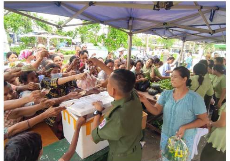
စစ်တွေမြို့ရှိ မုန်တိုင်းဒဏ်သင့်ပြည်သူများအား ဆန်၊ ဆီ၊ ဆား၊ ကြက်ဥ၊ ဟင်းသီးဟင်းရွက်များနှင့် စားသောက်ကုန်ပစ္စည်းများကို ဈေးနှုန်းသက်သာစွာဖြင့် ရောင်းချပေးစဉ်။

နေပြည်တော် ၈ နံနက် ၁၃ ဆိုင်ကလုန်းမုန်တိုင်း(မိုခါ) တိုက်ခတ်မှုကြောင့် ပျက်စီးမှုများဖြစ်ပေါ်ခဲ့သည့် စစ်တွေမြို့ရှိ မုန်တိုင်းဒဏ်သင့် ဒေသခံပြည်သူများနှင့် ဌာနဆိုင်ရာဝန်ထမ်းများ၏ စားသောက်ရေး အဆင်ပြေစေရန်နှင့် မိမိတို့အလိုရှိရာ စားသောက်ကုန်ပစ္စည်းများကို ဈေးနှုန်းသက်သာစွာဖြင့် ဝယ်ယူစားသောက်နိုင်ရေးအတွက် အနောက်ပိုင်းတိုင်းစစ်ဌာနချုပ် နယ်မြေခံတပ်မတော်သားများနှင့် တာဝန်ရှိသူများက နေ့စဉ်ရောင်းချပေးလျက်ရှိသည်။ ယနေ့တွင်လည်း စစ်တွေမြို့ ဦးဥတ္တမပန်းခြံ၌ ဆန်၊ ဆီ၊ ဆား၊ အသား၊ ငါးကြက်ဥ၊ ဘဲဥ၊ နို့ထွက်ပစ္စည်းများ၊ ဟင်းသီးဟင်းရွက်များ၊ ကြက်သွန်နီ၊ ကြက်သွန်ဖြူနှင့် တပ်မတော်စက်ရုံများနှင့် မြန်မာစီးပွားရေးကော်ပိုရေးရှင်းတို့မှ ထုတ်လုပ်သည့် ခေါက်ဆွဲခြောက်၊ ဘီစကွတ်နှင့် စည်သွတ်ဘူးများဖြစ်သည့် အမဲသားဘူး၊ မျှစ်စားတော်ပဲဘူး၊ ကြက်သားအာလူးဘူး၊ ငါးတန်အချိုပေါင်းဘူး၊ ငါးသလောက်ဘူး၊ ငပိကြော်ဘူး၊ ပဲထောပတ်ဘူး၊ ပဲခရမ်းဘူး၊ သရက်သီးသနပ်ဘူး စသည့် စားသောက်ကုန်များ၊ ပုဂ္ဂလိကလုပ်ငန်းရှင်များ၏ စားသောက်ကုန်ပစ္စည်းများ၊ လျှပ်စစ်ပစ္စည်းများနှင့် အိမ်ဆောက်ပစ္စည်းများကို ပြင်ပပေါက်ဈေးထက် သက်သာသော ဈေးနှုန်းများဖြင့် ဆက်လက်ရောင်းချပေးခဲ့ရာ ဒေသခံပြည်သူများနှင့် ဌာနဆိုင်ရာဝန်ထမ်းမိသားစုများက တစ်ခဲနက်ဝယ်ယူအားပေးခဲ့ကြောင်းနှင့် ယခုကဲ့သို့ စားရေးအခက်အခဲဖြစ်ပေါ်နေချိန်တွင် သက်သာသောဈေးနှုန်းများဖြင့် ရောင်းချပေးမှုအပေါ် တာဝန်ရှိသူများကို အထူးပင်ကျေးဇူးတင်ရှိကြောင်း သတင်းရရှိသည်။