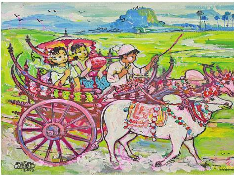
၏ အရွယ်အစားများမှာ (၃၆x၂၄) လက်မ၊ (၂၄x၂၄) လက်မ၊ (၁၈x၂၄) လက်မ၊ (၁၈x၁၈) လက်မ စသည်ဖြင့် အရွယ်အစား အစုံပါဝင်ပြီး စွေးနှုန်းအနေဖြင့် အနည်းဆုံး ငွေကျပ် ငါးသိန်းမှ သိန်း ၄၀ ထိ ရှိကြောင်း သိရသည်။ ASH

အတွက် အလွမ်းပြေပြပွဲလို့ ပြောနိုင်ပါ တယ်။ ဒီပြပွဲမှာ ပန်းချီတင်လှဝင်းထင်ရဲ့ နောက်ဆုံးလက်ရာ အများဆုံးရရှိထားပါ တယ်။ အလားတူ မဂ္ဂလင်းသရုပ်ဖော် ပန်းချီ လောကမှာ ကျော်ကြားတဲ့ ပန်းချီဝေမွန် လင်းရဲ့ နောက်ဆုံးလက်ရာတွေလဲ ပြသ ထားမှာဖြစ်ပါတယ်။ ရိုးရာတစ်ကြောင်း ပန်းချီနဲ့နာမည်ကြီးတဲ့ ပန်းချီ ကြည်သိန်း၊ တစ်ပင်တိုင်အက လက်ရာတွေနဲ့ ပြည့်ပ စွေးကွက်ရထားတဲ့ ဆရာစတားမြသန်းရဲ့ လက်ရာတွေလဲ မြင်ရမှာပါ”ဟု ပန်းချီ မောင်မောင်စောက ပြောပြသည်။ ပြပွဲတွင် ပြသပေးမည့် ပန်းချီကားများ