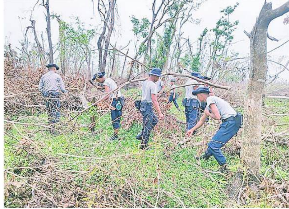
သဘာဝ ဘေးအန္တရာယ် ကျရောက်သော ဒေသများတွင် တပ်မတော်မှ ကူညီကယ်ဆယ်ရေး အဖွဲ့များက ကူညီကယ်ဆယ်ရေး နှင့် ပြန်လည် ထူထောင်ရေး လုပ်ငန်းများ ပူးပေါင်းပါဝင် ဆောင်ရွက်ပေးစဉ်။

ပညာသိတာရာမ ပရိယတ္တိစာသင်တိုက် အတွင်း၌ ဒေသခံပြည်သူများကို ကျန်းမာရေးစောင့်ရှောက်မှုလုပ်ငန်းများ ဆောင်ရွက်ပေးလျက်ရှိသည်။ အလားတူ စစ်တွေမြို့သို့ရောက်ရှိ နေသော ကူညီကယ်ဆယ်ရေးအဖွဲ့များ သည် ရေချမ်းပြင်ကျေးရွာအတွင်းရှိ လဲကျ နေသော သစ်ပင်သစ်ကိုင်းကြီးများ ခုတ်ထွင်ရှင်းလင်းခြင်းလုပ်ငန်းများ ဆောင် ရွက်ပေးလျက်ရှိသည်။ ၎င်းအဖွဲ့တွင်ပါဝင် သည့် ဆေးကုသရေးအဖွဲ့များသည်လည်း သက်ကယ်ပြင်ရွာမကျေးရွာရှိ ဒေသခံ ပြည်သူများကို ကျန်းမာရေးစောင့်ရှောက် မှုလုပ်ငန်းများ ဆောင်ရွက်ပေးလျက် ရှိသည်။ ထို့အတူ မောင်တောမြို့သို့ရောက်ရှိ နေသည့် ကူညီကယ်ဆယ်ရေးအဖွဲ့များ သည် နယ်လှည့်ဆေးကုသရေးအဖွဲ့များနှင့် ပူးပေါင်း၍ လသာကျေးရွာရှိ ဒေသခံ ပြည်သူများကို ကျန်းမာရေးစောင့်ရှောက်မှု