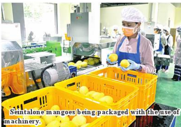
Seintalone mangoes being packaged with the use of machinery.