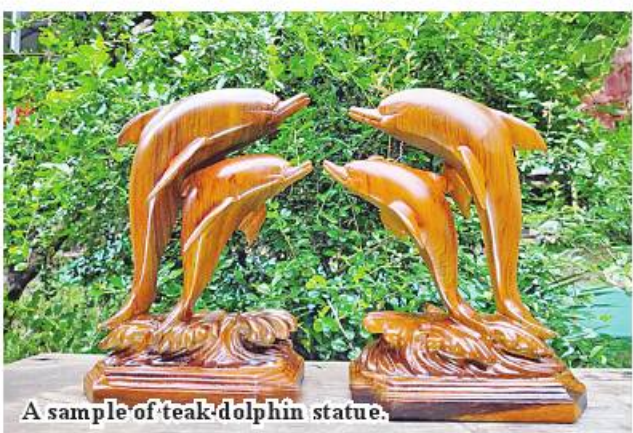
A sample of teak dolphin statue.