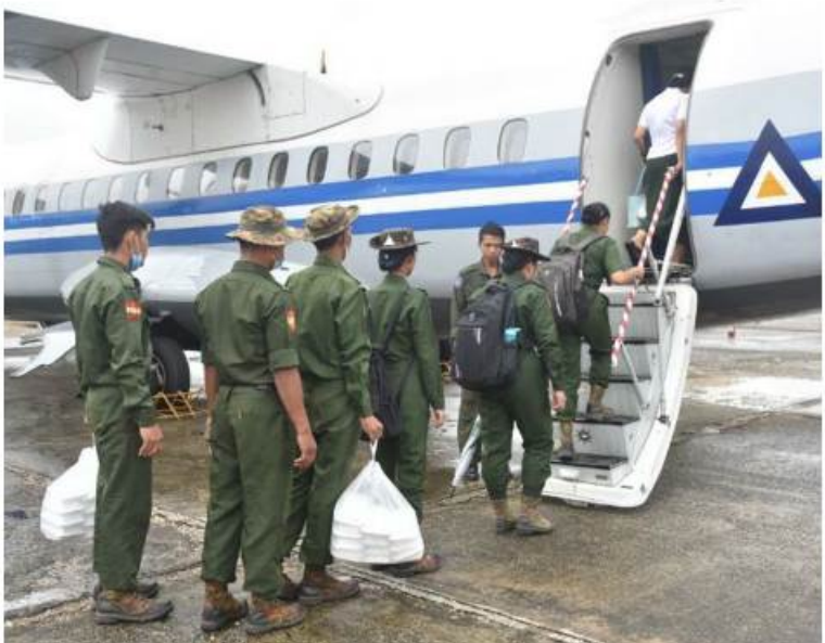
နေပြည်တော် ဇွန် ၁၃ - တပ်မတော်(လေ)အနေဖြင့် သဘာဝ ဘေးဒဏ်သင့်ဒေသများသို့ တပ်မတော် (ကြည်း၊ရေ၊လေ)မိသားစုများ၊ စေတနာ ရှင်အလှူရှင်များက လှူဒါန်းသည့် စားသောက်ဖွယ်ရာများ၊ ကူညီထောက်ပံ့ ရေးပစ္စည်းများ၊ အမျိုးသားသဘာဝဘေး အန္တရာယ်ဆိုင်ရာ စီမံခန့်ခွဲမှုကော်မတီက ထောက်ပံ့ပေးအပ်သည့် ပစ္စည်းများကို တပ်မတော်(လေ)မှ ရဟတ်ယာဉ်များ ဖြင့် ကူညီပို့ဆောင်ပေးလျက်ရှိသည်။ ပြန်လည်ထူထောင်ရေး လုပ်ငန်းများ တွင် ကူညီဆောင်ရွက်ပေးကြမည့် တပ်မတော်သားများနှင့် ဌာနဆိုင်ရာ ဝန်ထမ်းများကို တပ်မတော်(လေ)မှ လေယာဉ်ဖြင့် ပို့ဆောင်ပေးစဉ်။

ထိုသို့ ပို့ဆောင်ပေးလျက်ရှိရာ ယနေ့ တွင် ဆေးဝန်ထမ်းညွှန်ကြားရေးမှူးရုံး ကွပ်ကဲမှုအောက်ရှိ အထူးဆေးအကာ အကွယ်ပေးအဖွဲ့ဝင် ၁၅ ဦးနှင့် အရေးပေါ် သုံးဆေးပစ္စည်းများ စုစုပေါင်း ၂ ဒသမ ၆ တန်ကိုတင်ဆောင်၍ ရန်ကုန်အပြည်ပြည် ဆိုင်ရာလေဆိပ်မှ စစ်တွေလေဆိပ်သို့ လည်းကောင်း၊ လူမှုဝန်ထမ်း၊ ကယ်ဆယ် ရေးနှင့် ပြန်လည်နေရာချထားရေးဝန်ကြီး ဌာနမှပေးပို့သော စုစုပေါင်း ဆန်အိတ် ၁၆၀၊ ရုတ်တန်ကို မန္တလေးအပြည်ပြည် ဆိုင်ရာလေဆိပ်မှ ကလေးလေဆိပ်သို့ လည်းကောင်း တပ်မတော်(လေ)မှ လေယာဉ်များဖြင့် ပို့ဆောင်ပေးခဲ့သည်။ သဘာဝ ဘေးဒဏ်သင့်ဒေသများရှိ ပြည်သူများအတွက် ကယ်ဆယ်ရေးပစ္စည်း များကို တပ်မတော်(လေ)မှ လေယာဉ်၊ ရဟတ်ယာဉ်များဖြင့် အချိန်နှင့်တစ်ပြေးညီ ပို့ဆောင်ပေးလျက်ရှိရာ ယနေ့အချိန်ထိ ထောက်ပံ့ရေးပစ္စည်း ၅၀၃ ဒသမ ၉ တန်၊ ပြန်လည်ထူထောင်ရေး လုပ်ငန်းများတွင် ကူညီဆောင်ရွက်ပေးကြမည့် တပ်မတော် သားများနှင့် ဌာနဆိုင်ရာဝန်ထမ်း ၃၂၉၁ ဦးတို့ကို ပို့ဆောင်ပေးနိုင်ခဲ့ကြောင်းနှင့် လေဆိပ်များသို့ရောက်ရှိသည့် ကယ်ဆယ် ရေးပစ္စည်းများကို မုန်တိုင်းဒဏ်သင့်ဒေသ များသို့ ရဟတ်ယာဉ်များဖြင့် ဆက်လက် ပေးပို့ဖြန့်ဖြူးလျက်ရှိကြောင်းနှင့် အဆိုပါ တပ်မတော် လေယာဉ်၊ ရဟတ်ယာဉ်များ ဖြင့် ပို့ဆောင်ပေးလျက်ရှိသော ပစ္စည်းများ ကို တာဝန်ရှိသူများက လက်ခံရယူခဲ့ကြ ကြောင်း သတင်းရရှိသည်။