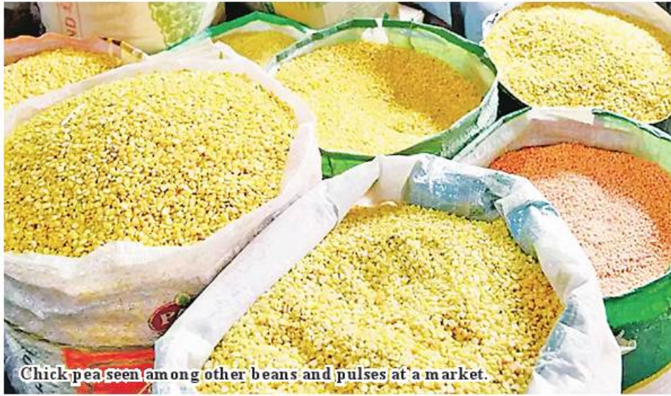
Chick pea seen among other beans and pulses at a market.

Nay Pyi Taw June 13 The Ministry of Commerce stated that more than US$3 million in export of chick pea within two months of 2023-24 financial year. Myanmar stands the fifth in producing the largest volume of chick pea. India