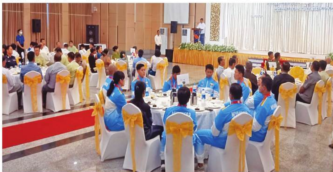
မွန်ပြည်နယ်ဝန်ကြီးချုပ် ဦးအောင်ကြည်သိန်း နိုင်ငံ့ဂုဏ်ဆောင် နည်းပြများနှင့် အားကစားသမားများအား ဂုဏ်ပြုချီးမြှင့်ခြင်း အခမ်းအနားတွင် အမှာစကားပြောကြားစဉ်။

ဦးစွာ မွန်ပြည်နယ်ဝန်ကြီးချုပ်နှင့် ရန်ကုန်တိုင်းဒေသကြီး ဝန်ကြီးချုပ်တို့က ဂုဏ်ပြုအမှာစကားများ အသီးသီးပြောကြား ကြသည်။ ထို့နောက် ဝန်ကြီးချုပ်များ၊ တိုင်းမှူးများနှင့် တာဝန်ရှိသူများက ဆုရရှိ ခဲ့သည့် နိုင်ငံ့ဂုဏ်ဆောင် နည်းပြများနှင့် အားကစားသမားများကို ဂုဏ်ပြုဆုငွေနှင့် ဂုဏ်ပြုမှတ်တမ်းလွှာများ အသီးသီးပေးအပ် ချီးမြှင့်ကြသည်။ ယင်းနောက် နိုင်ငံ့ ဂုဏ်ဆောင် အားကစားသမားများကိုယ်စား အားကစားအမျိုးအစားအလိုက် အားကစား သမားတစ်ဦးချင်းစီက ကျေးဇူးတင်စကား များပြန်လည်ပြောကြားကြသည်။ ၎င်းနောက် တိုင်းဒေသကြီးနှင့်ပြည်နယ်များမှ ဝန်ကြီးချုပ် များ၊ တိုင်းမှူးများနှင့် တာဝန်ရှိသူများက နိုင်ငံ့ဂုဏ်ဆောင် အားကစားသမားများကို ရင်းရင်းနှီးနှီး လိုက်လံနွှတ်ဆက်အားပေး ကာ စုပေါင်းမှတ်တမ်းတင်ဓာတ်ပုံရိုက်ခဲ့ ကြကြောင်း သတင်းရရှိသည်။