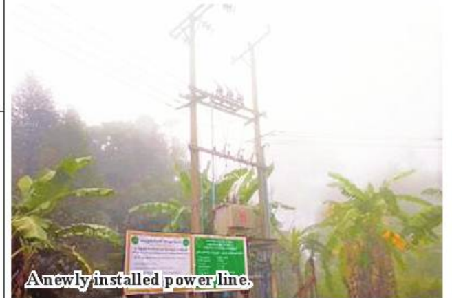
A newly installed power line.

So far, installation tasks have completed by 90 per cent, with the aim of electrifying 65 households for 234 people. 336