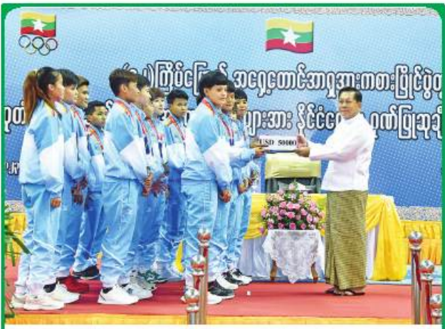
အားကစားကို မြှင့်တင်ခြင်းဖြင့် နိုင်ငံ့ဂုဏ် တင့်စေဖွယ်