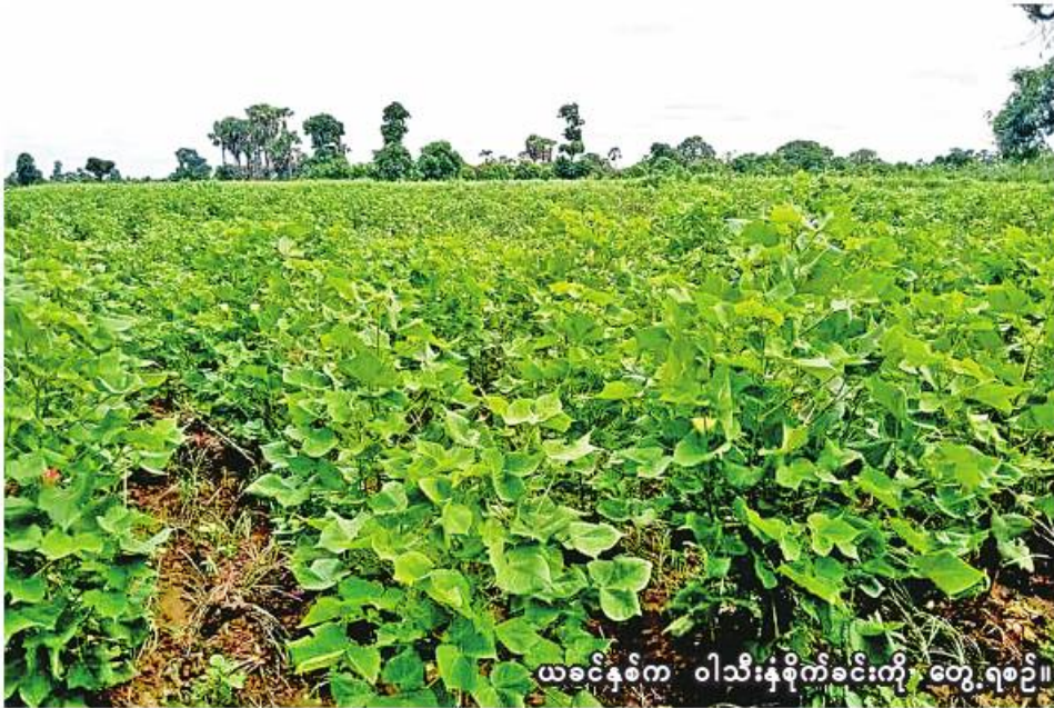
ယခင်နှစ်က ဝါသီးနှံစိုက်ခင်းကို တွေ့ရစဉ်။

မုံရွာ ၈ နှစ် ၁၃ စစ်ကိုင်းတိုင်းဒေသကြီးတွင် ယခုနှစ် မိုးသီးနှံစိုက်ပျိုးရာသီ၌ ဝါသီးနှံကေ ၈၂၄၀၀ စိုက်ပျိုးသွားမည်ဖြစ်ကြောင်း စစ်ကိုင်းတိုင်းဒေသကြီး စိုက်ပျိုးရေးဦးစီးဌာနမှ သိရသည်။ စစ်ကိုင်းတိုင်းဒေသကြီးတွင် ယခုနှစ် မိုးသီးနှံစိုက်ပျိုးရာသီ၌ ဝါစိုက်ပျိုးမှု ခရိုင်လိုက်အနေဖြင့် မုံရွာခရိုင်တွင် ၃၁၇၇၅ ဧက၊ ယင်း