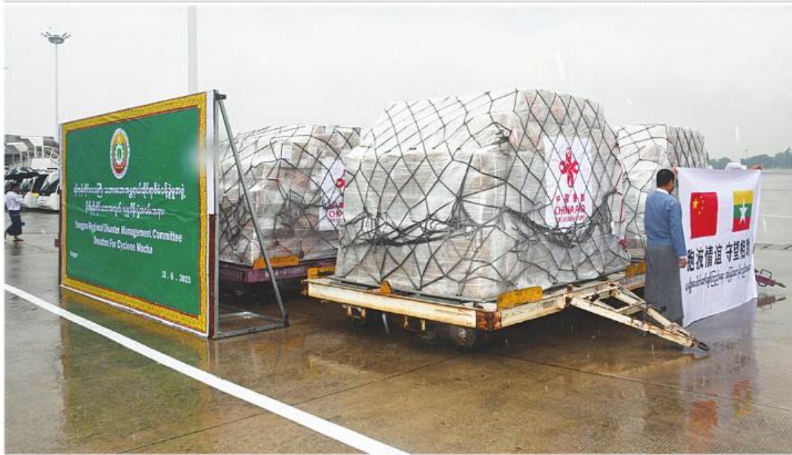
တရုတ်ပြည်သူ့သမ္မတနိုင်ငံအစိုးရက မြန်မာနိုင်ငံမုန်တိုင်းဒဏ်သင့်ဒေသများအတွက် လှူဒါန်းသည့် လူသားချင်းစာနာထောက်ထားမှုဆိုင်ရာ ထောက်ပံ့ရေးပစ္စည်းများ ရောက်ရှိစဉ်။