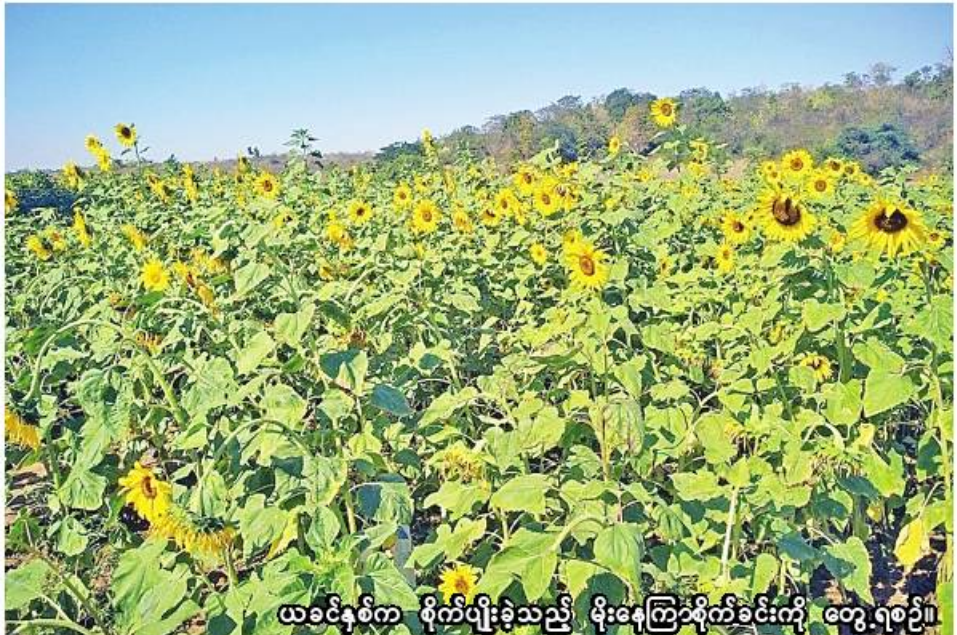
ယခင်နှစ်က စိုက်ပျိုးခဲ့သည့် မိုးနေကြာစိုက်ခင်းကို တွေ့ရစဉ်။