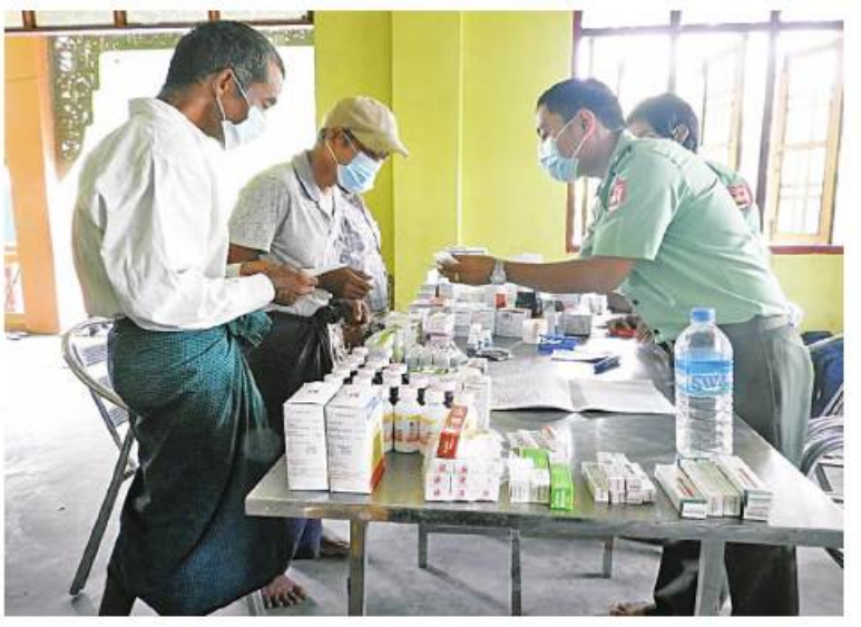
အလယ်ပိုင်းတိုင်းစစ်ဌာနချုပ် နယ်မြေခံဆေးကုသရေးအဖွဲ့က သာစည်မြို့နယ် ဘုရားငါးဆူကျေးရွာရှိ ဒေသခံပြည်သူများကို ကျန်းမာရေးစောင့်ရှောက်မှုလုပ်ငန်း များ ဆောင်ရွက်ပေးစဉ်။

ဦးတို့ကို သွေးတိုးရောဂါ၊ အဆစ်အဖျက် ရောဂါ၊ ဆီးချိုရောဂါ၊ အသက်ရှူ လမ်းကြောင်းဆိုင်ရာရောဂါ၊ မျက်စိရောဂါ၊ သွားနှင့်ခံတွင်းရောဂါ၊ ခွဲစိတ်ကုသမှုဆိုင်ရာ ရောဂါ၊ သားဖွားမီးယပ်ရောဂါ၊ ကလေး ရောဂါ၊ အထွေထွေရောဂါတို့နှင့်ပတ်သက် ၍ လိုအပ်သည့် ကျန်းမာရေးစောင့်ရှောက် မှုလုပ်ငန်းများ ဆောင်ရွက်ပေးလျက် ရှိသည်။ ယင်းသို့ ဆောင်ရွက်ပေးနေမှု များကို တာဝန်ရှိသူများက သွားရောက် ကြည့်ရှုအားပေးခဲ့ကြောင်း သတင်း ရရှိသည်။