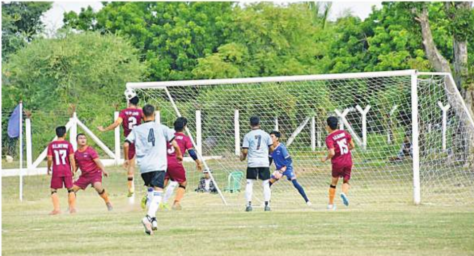
၂၀၂၃ ခုနှစ် ကာကွယ်ရေး ဦးစီးချုပ်(လေ) တံခွန်စိုက်ခိုင်း ဘောလုံးပြိုင်ပွဲတွင် မြေပြင်အတတ်သင် လေတပ်စခန်း ဌာနချုပ်အသင်းနှင့် မြိတ်လေတပ်စခန်း ဌာနချုပ် အသင်းတို့ ယှဉ်ပြိုင်ကစားစဉ်။

ကာကွယ်ရေးဦးစီးချုပ်(လေ) တံခွန် စိုက်ခိုင်း ဘောလုံးပြိုင်ပွဲကို ယနေ့ညနေ ပိုင်းတွင် မန္တလေးတိုင်းဒေသကြီး မိတ္ထီလာ မြို့ မြေပြင်အတတ်သင် လေတပ်စခန်းဌာန ချုပ် ဘောလုံးအားကစားကွင်း၌ ပြုလုပ်ရာ လေကြောင်းအတတ်သင် လေတပ်စခန်း ဌာနချုပ် ဌာနချုပ်မှူး၊ မိတ္ထီလာတပ်နယ် မှ တပ်မတော်အရာရှိကြီးများ၊ အရာရှိ၊ စစ်သည်များ၊ ခိုင်အဖွဲ့ဝင်များ၊ ပြိုင်ပွဲဝင် အသင်းများနှင့် အားကစားဝါသနာရှင်များ တက်ရောက်ကြသည်။