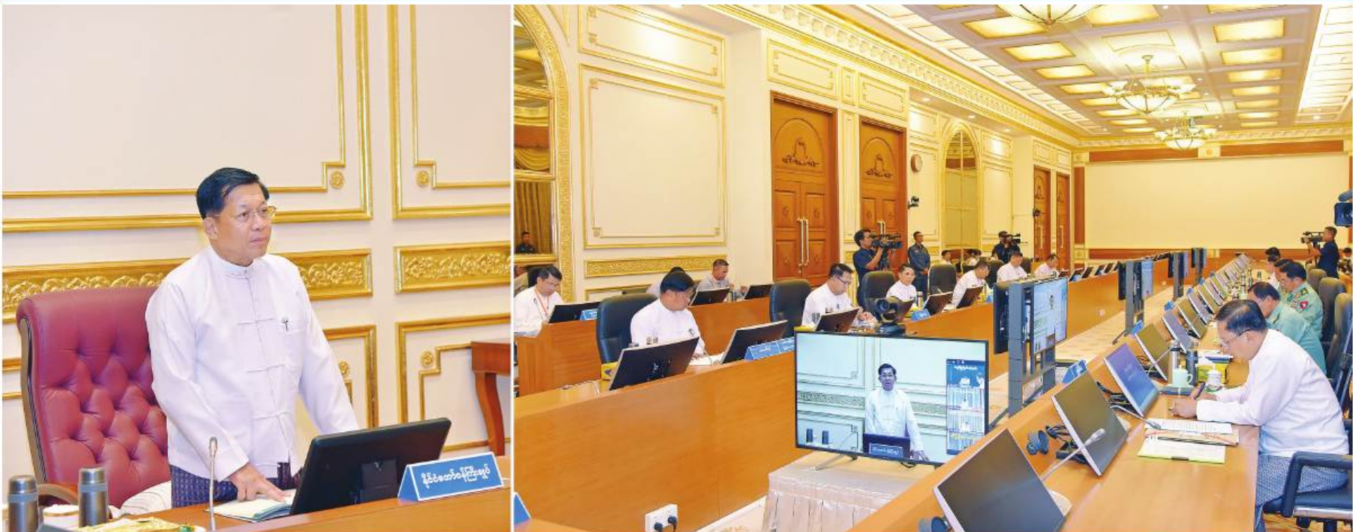
နိုင်ငံတော်စီမံအုပ်ချုပ်ရေးကောင်စီဥက္ကဋ္ဌ နိုင်ငံတော်ဝန်ကြီးချုပ် ဝိုင်းချုပ်မှူးကြီးမင်းအောင်လှိုင် အခြေခံစားသုံးကုန်ပစ္စည်းများ တိုးမြှင့်ထုတ်လုပ်ရေးအစည်းအဝေးတွင် အမှာစကားပြောကြားစဉ်။

နေပြည်တော် ဇွန် ၁၂ ဥက္ကဋ္ဌရုံးအစည်းအဝေးခန်းမ၌ ကျင်းပပြုလုပ်ရာ အစည်းအဝေးသို့ နိုင်ငံတော်စီမံအုပ်ချုပ်ရေး မောင်အုန်း၊ ဦးမင်းနောင်၊ နေပြည်တော်ကောင်စီ အခြေခံစားသုံးကုန်ပစ္စည်းများ တိုးမြှင့်ထုတ် နိုင်ငံတော်စီမံအုပ်ချုပ်ရေးကောင်စီဥက္ကဋ္ဌ နိုင်ငံ ကောင်စီအဖွဲ့ဝင်များဖြစ်ကြသည့် ဝိုင်းချုပ်ကြီး ဥက္ကဋ္ဌ ဦးတင်ဦးလွင်၊ ကာကွယ်ရေးဦးစီးချုပ်ရုံးမှ လုပ်ရေးအစည်းအဝေးကို ယနေ့မွန်းလွဲပိုင်းတွင် တော်ဝန်ကြီးချုပ် ဝိုင်းချုပ်မှူးကြီးမင်းအောင်လှိုင် တင်အောင်စန်းနှင့်ဒုတိယဝိုင်းချုပ်ကြီးမိုးမြင့်ထွန်း၊ တပ်မတော်အရာရှိကြီးများ၊ ဒုတိယဝန်ကြီးများနှင့် နေပြည်တော်ရှိ နိုင်ငံတော်စီမံအုပ်ချုပ်ရေးကောင်စီ တက်ရောက်အမှာစကားပြောကြားသည်။ ပြည်ထောင်စုဝန်ကြီးများဖြစ်ကြသည့် ဦးမောင်