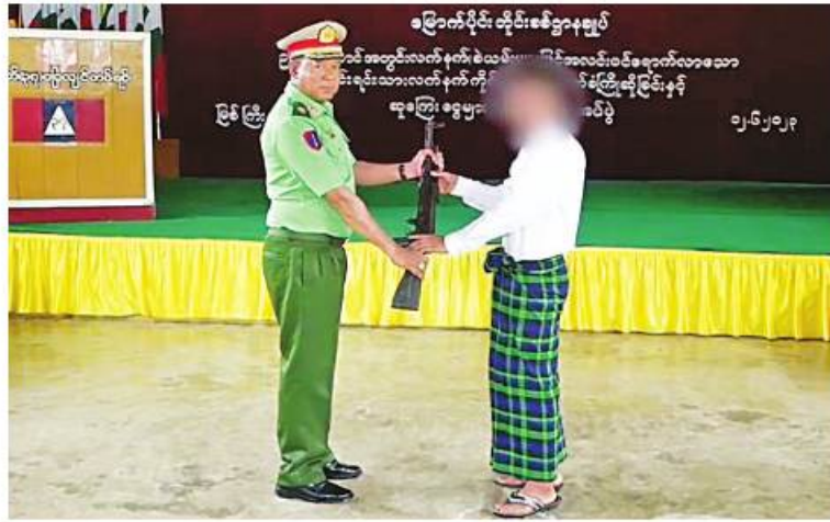
မြောက်ပိုင်းတိုင်းစစ်ဌာနချုပ် မြစ်ကြီးနားတပ်နယ်မှ တာဝန်ရှိသူတစ်ဦးထံ ဥပဒေဘောင်အတွင်း ပြန်လည်ဝင်ရောက်လာသည့် KIA အဖွဲ့ဝင်တစ်ဦးက လက်နက်၊ ခဲယမ်းများ အပ်နှံစဉ်။

နေပြည်တော် ဇွန် ၁၂ နိုင်ငံတော်စီမံအုပ်ချုပ်ရေး ကောင်စီသည် PDF အပါအဝင် အဖွဲ့အစည်း အမျိုးမျိုးအမည်ခံ၍ လက်နက်ကိုင် ဆန့်ကျင်လျက်ရှိသည့် အဖွဲ့အစည်းများ အတွင်း ရောက်ရှိနေသူများကို ဥပဒေဘောင်အတွင်းသို့ ပြန်လည်ဝင်ရောက်ရန် ဖိတ်ခေါ်လျက်ရှိပြီး ဥပဒေဘောင်အတွင်း သို့ ဝင်ရောက်လာသူများကိုလည်း လိုအပ်သည့် ကူညီပံ့ပိုးမှုများ ဆောင်ရွက်ပေးသွားမည်ဖြစ်ကြောင်းနှင့် လက်နက် ခဲယမ်းများဖြင့် ဝင်ရောက်လာသူများကို ဆုကြေးငွေများ သီးသန့်ထောက်ပံ့ပေးသွားမည်ဖြစ်ကြောင်း သတင်းထုတ်ပြန်ခဲ့ပြီး ဖြစ်သည်။ ယင်းသို့ နိုင်ငံတော်စီမံအုပ်ချုပ်ရေး ကောင်စီက သတင်းထုတ်ပြန်ဖိတ်ခေါ်၍