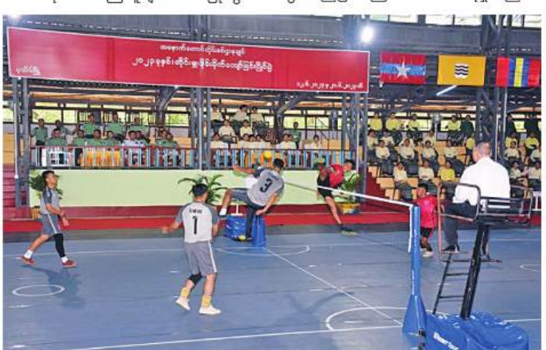
အနောက်တောင်တိုင်းစစ်ဌာနချုပ် ၂၀၂၃ ခုနှစ် တိုင်းမှူးခိုင်း ပိုက်ကျော်ခြင်းပြိုင်ပွဲ ပထမနေ့ပွဲစဉ် ယှဉ်ပြိုင်ကစားစဉ်။

အနောက်တောင်တိုင်း စစ်ဌာနချုပ် ၂၀၂၃ ခုနှစ် တိုင်းမှူးခိုင်း ပိုက်ကျော်ခြင်း ပြိုင်ပွဲ ဖွင့်ပွဲကို ယနေ့ညနေပိုင်းတွင် တိုင်းစစ်ဌာနချုပ် အားကစားရုံ၌ပြုလုပ်ရာ တိုင်းမှူး ဗိုလ်မှူးချုပ်ကြည်ခိုင်နှင့် တာဝန် ရှိသူများ၊ အရာရှိ၊ စစ်သည်၊ မိသားစုဝင်များ၊ ပြိုင်ပွဲဝင် အားကစားသမားများ၊ ခိုင်အဖွဲ့ ဝင်များနှင့် ဖိတ်ကြားထားသူများ တက်ရောက်ကြသည်။