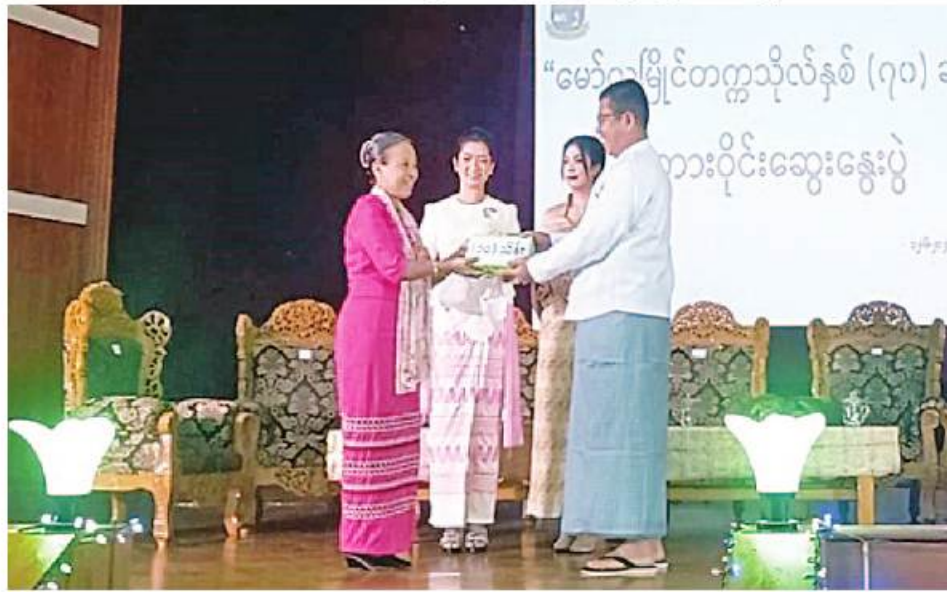
ဖွန်ပြည်နယ် ဝန်ကြီးချုပ် ဦးအောင်ကြည်သိန်း မော်လမြိုင် တက္ကသိုလ် နှစ်(၇၀)ပြည့် အထိမ်းအမှတ် အတွက် ထောက်ပံ့ငွေများ ပေးအပ်စဉ်။

ဖွန်ပြည်နယ် ဝန်ကြီးချုပ် ဦးအောင်ကြည်သိန်းက အဖွင့် အမှာစကားပြောကြားပြီး မော်လမြိုင် တက္ကသိုလ် နှစ်(၇၀)ပြည့်အထိမ်းအမှတ် အတွက် ထောက်ပံ့ငွေများပေးအပ်ရာ အဆိုပါတက္ကသိုလ် ပါမောက္ခချုပ် ဒေါက်တာယဉ်မျိုးသူက လက်ခံရယူသည်။ ထို့နောက် စကားဝိုင်းဆွေးနွေးပွဲကို နှင့် ကျောင်းအုပ်ကြီးများ၊ မော်လမြိုင် တက္ကသိုလ်ကျောင်းသားဟောင်းများ၊ ဆရာ၊ ဆရာမများနှင့် ကျောင်းသား၊ ကျောင်းသူ များ တက်ရောက်ကြသည်။