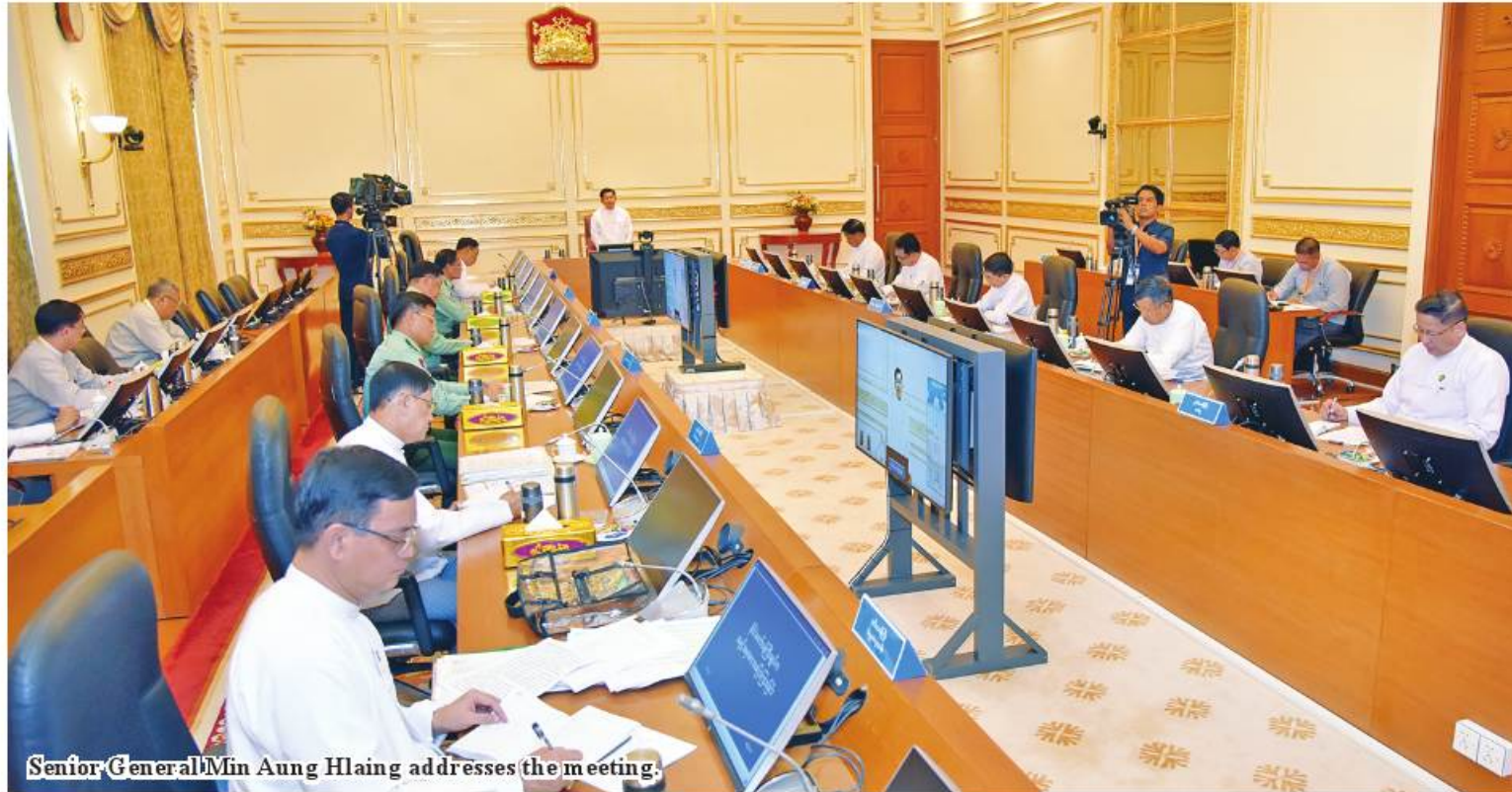
Senior General Min Aung Hlaing addresses the meeting.