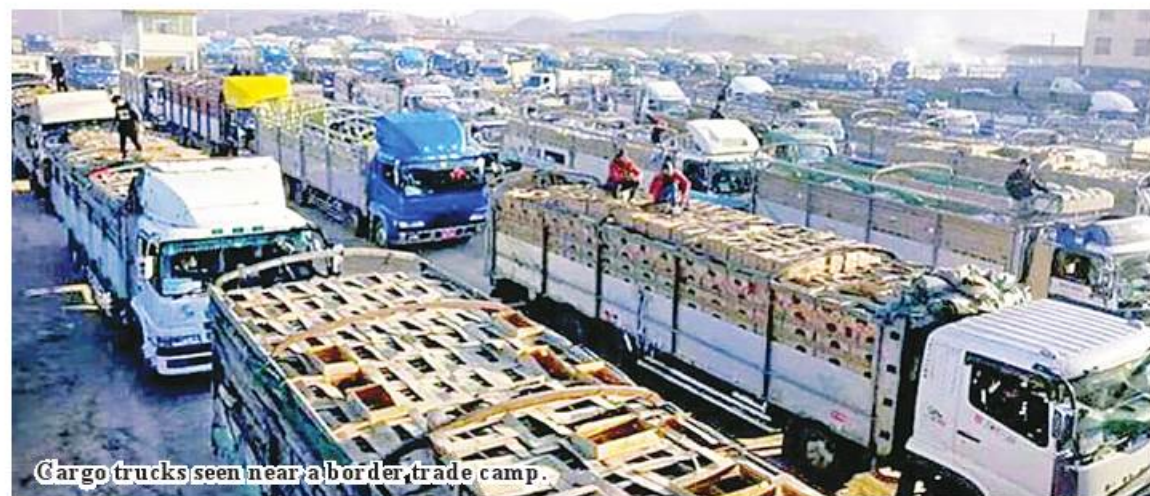
Cargo trucks seen near a border trade camp.