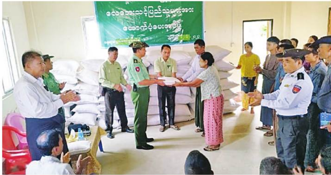
ကာကွယ်ရေးဦးစီးချုပ်ရုံး(ကြည်း)မှ ဒုတိယဗိုလ်ချုပ်ကြီးအေးဝင်း မုန်တိုင်းဒဏ်သင့်ပြည်သူများကို ထောက်ပံ့ပစ္စည်းများ ပေးအပ်စဉ်။

နေပြည်တော် ဇွန် ၁၂ နိုင်ငံတော် စီမံအုပ်ချုပ်ရေးကောင်စီ အနေဖြင့် ဆိုင်ကလုန်းမုန်တိုင်း(မိုခါ) တိုက်ခတ်မှုကြောင့် ထိခိုက်ပျက်စီးခဲ့သည့် ဒေသများကို သဘာဝဘေးအန္တရာယ် ဆိုင်ရာ စီမံခန့်ခွဲမှုဥပဒေ ပုဒ်မ ၁၁ အရ