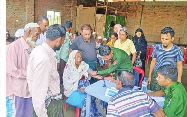
သဘာဝဘေးအန္တရာယ် ကျရောက်သောဒေသများတွင် တပ်မတော်မှ ကူညီ ကယ်ဆယ်ရေးအဖွဲ့များက ဒေသခံပြည်သူများကို ကျန်းမာရေးစောင့်ရှောက်မှု လုပ်ငန်းများ ဆောင်ရွက်ပေးစဉ်။

နေသော ကူညီကယ်ဆယ်ရေးအဖွဲ့များ သည် ရွှေတောင်ကျောင်းတိုက်အတွင်းရှိ သစ်ပင်သစ်ကိုင်း ခုတ်ထွင်ရှင်းလင်းခြင်း လုပ်ငန်းများ ဆောင်ရွက်ပေးလျက်ရှိသည်။ ထို့နောက် ဝိနမာရ်အောင်ကျောင်းတိုက် အတွင်း၌ ဒေသခံပြည်သူများကို ကျန်းမာရေး စောင့်ရှောက်မှုလုပ်ငန်းများ ဆောင်ရွက် ပေးနေမှုများကို ကူညီဆောင်ရွက် ပေးသည်။ ထို့အတူ ကျောက်တော်မြို့သို့ရောက်ရှိ နေသော ကူညီကယ်ဆယ်ရေးအဖွဲ့များ သည် ကျောက်တော်မြို့အတွင်းရှိ လမ်းဘေး ဝဲယာမှ လဲကျနေသော သစ်ပင်သစ်ကိုင်း ခုတ်ထွင်ရှင်းလင်းခြင်း လုပ်ငန်းများ ဆောင်ရွက်ပေးလျက်ရှိကြောင်း သတင်း ရရှိသည်။ >>>