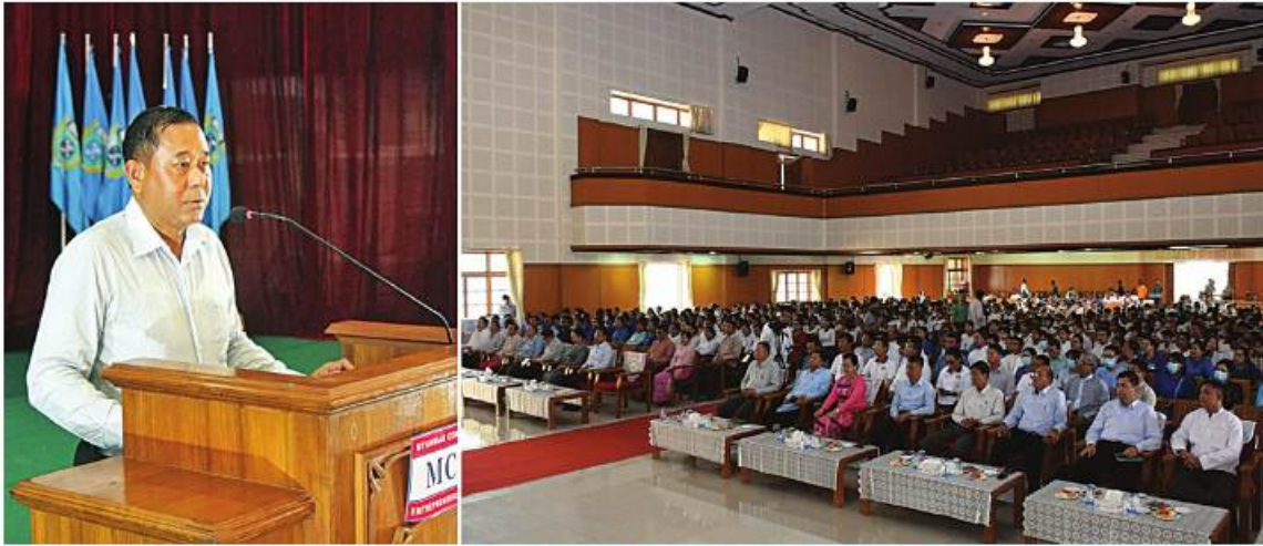
ပြည်ထောင်စုဝန်ကြီး ဒုတိယဗိုလ်ချုပ်ကြီးထွန်းထွန်းနောင် မြန်မာနိုင်ငံ ဆောက်လုပ်ရေးဆိုင်ရာ လုပ်ငန်းရှင်များအသင်းချုပ်က စစ်တွေတက္ကသိုလ်သို့ ရေသန့်စက်လှူဒါန်းခြင်းနှင့် စစ်တွေမြို့ရှိ အခြေခံပညာကျောင်းများမှ ကျောင်းသား၊ ကျောင်းသူ ကလေးငယ် များကို ပဲခူးအာဟာရတိုက်ကျွေးခြင်းစီမံချက်စတင်ခြင်းအခမ်းအနားတွင် အမှာစကားပြောကြားစဉ်။

ထို့နောက် မြန်မာနိုင်ငံဆောက်လုပ်ရေး ဆိုင်ရာ လုပ်ငန်းရှင်များအသင်းချုပ်ဥက္ကဋ္ဌ ဦးရှိန်ဝင်းက လှူဒါန်းမှုနှင့်စပ်လျဉ်း၍ ရှင်းလင်းတင်ပြပြီး စစ်တွေတက္ကသိုလ် အတွက် စုစုပေါင်းငွေကျပ်သိန်း ၃၅၀ တန်ဖိုး ရှိရေသန့်စက်နှင့်ဆက်စပ်ပစ္စည်းများ၊ စစ်တွေ မြို့နယ်ရှိ အခြေခံပညာကျောင်းများမှ ကျောင်းသား၊ ကျောင်းသူကလေးငယ်များ ကို ပဲခူးအာဟာရတိုက်ကျွေးရေးစီမံချက် စာအုပ်တို့ကိုပေးအပ်လှူဒါန်းရာ ပညာရေး ဝန်ကြီးဌာန ဒုတိယဝန်ကြီး ဒေါက်တာ ဦးထိန်လင်းက လက်ခံရယူပြီး ဂုဏ်ပြု မှတ်တမ်းလွှာပြန်လည်ပေးအပ်၍ ပြည်နယ် ဝန်ကြီးချုပ် ဦးထိန်လင်းက လှူဒါန်းမှုအတွက်