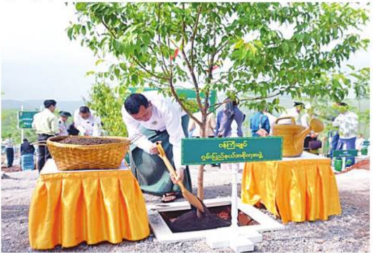
ရှမ်းပြည်နယ်ဝန်ကြီးချုပ် ဦးအောင်စောအေး သတ်မှတ်နေရာတွင် ပျိုးပင်ကို စိုက်ပျိုးပေးစဉ်။

ရှမ်းပြည်နယ်(တောင်ပိုင်း) တောင်ကြီးမြို့ ပြည်နယ်အဆင့် ၂၀၂၃ ခုနှစ် မိုးရာသီ သစ်ပင်စိုက်ပျိုးပွဲကို ယနေ့နံနက်ပိုင်း တွင် တောင်ကြီးမြို့ ကန်ကြီးရပ်ကွက် တောင်ကြီး-ဟိုပုံးသွား ကားလမ်းဘေး လွိုင်ခမ်းအိမ်ရာ တောင်ကြီး(ထင်းကြီးပိုင်း)၌ ပြုလုပ်ရာ ရှမ်းပြည်နယ်ဝန်ကြီးချုပ် ဦးအောင်စော အေး၊ အရှေ့ပိုင်းတိုင်းစစ်ဌာနချုပ် ဒုတိယ တိုင်းမှူး ဗိုလ်မှူးချုပ်ဝင်းဇော်မိုး၊ ရှမ်းပြည် နယ်အစိုးရအဖွဲ့ဝင်များ၊ တောင်ကြီး တပ်နယ်မှ အရာရှိ၊ စစ်သည်များ၊ သစ်တော ဦးစီးဌာနမှ တာဝန်ရှိသူများ၊ တက္ကသိုလ် အသီးသီးမှ ဆရာ၊ ဆရာမများ၊ ကျောင်း သား၊ ကျောင်းသူများ၊ လူမှုရေးအသင်း များကို လိုက်လံကြည့်ရှုအားပေးခဲ့ကြ အဖွဲ့ဝင်များနှင့် ဒေသခံပြည်သူများ တက်ရောက်ကြသည်။