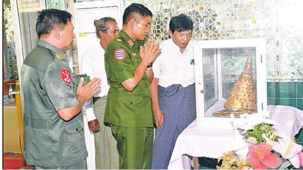
မြေလျင်လှုပ်ခတ်မှုကြောင့် မအူပင်မြို့ရှိ ရွှေဘုန်းမြင့်စေတီတော် စိန်ဖူးတော်မြေခဲမှုကို တိုင်းမှူး ဝိုင်းဖူးချုပ်ကြည်ခိုင် သွားရောက်ကြည့်ရှုစဉ်။

နေပြည်တော် ဇွန် ၈ ၂၀၂၃ ခုနှစ် ဇွန် ၇ ရက် ညနေပိုင်းတွင် တမ္ဘာအေးမြေလျင်စခန်းမှ အနောက်၊ အနောက်မြောက်ဘက် ၁၃ မိုင်ခန့်အကွာ ညောင်တုန်းမြို့၏တောင်ဘက် အရှေ့တောင်ဘက် ငါးမိုင်ခန့်အကွာကို ဝဟိုပြု၍ အင်အားရစ်(ချီ)တာစကေး ၄ ဒသမ ၈ အဆင့်ရှိ အင်အားအနည်းငယ်ရှိသော မြေလျင်တစ်ခု လှုပ်ခတ်ခဲ့သဖြင့် ရောဂတီ တိုင်းဒေသကြီး မအူပင်မြို့နယ် အမှတ်(၃) ရပ်ကွက်ရှိ ရွှေဘုန်းမြင့်စေတီတော် မြတ်ကြီး ထီးတော်ယိုင်လဲ၍ စိန်ဖူးတော် မြေခဲခဲ့ပြီး အမှတ်(၄)ရပ်ကွက် မိုးကုတ် ဝိပဿနာတရားစခန်း အဝင်ဝရှိ မျက်နှာ ကြက်နှင့် ထုပ်တန်းပြိုကျရာမှ သီလရှင် တစ်ပါးနှင့် တရားအားထုတ်သူ အမျိုးသမီး တစ်ဦး သေဆုံးခဲ့သည်။ ထို့ပြင် အိုင်ဝိုင်း ကျေးရွာအုပ်စု အိုင်ဝိုင်းကျေးရွာရှိ မအူပင်တက္ကသိုလ် ဘွဲ့နှင်းသဘင်ဆောင်