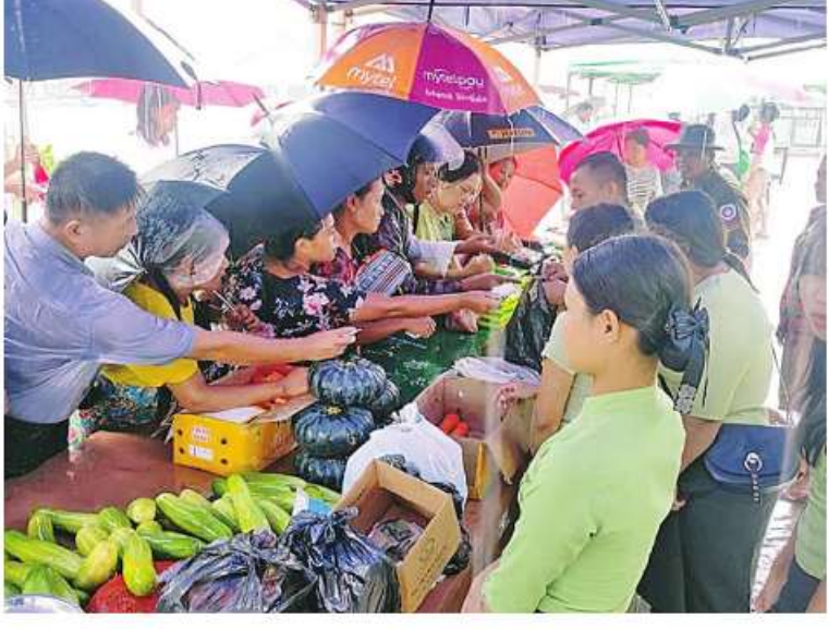
နေပြည်တော် ၇ ဇူလိုင် - ဆိုင်ကလုန်းမုန်တိုင်း(မိုခါ) တိုက်ခတ်မှုကြောင့် ဖျက်စီးဆုံးရှုံးမှုများဖြစ်ပေါ်ခဲ့သည့် စစ်တွေမြို့ရှိ မုန်တိုင်းဒဏ်သင့်ဒေသခံပြည်သူများနှင့် ဌာနဆိုင်ရာဝန်ထမ်းများ၏ စားသောက်ရေးအဆင်ပြေစေရန်နှင့် မိမိတို့အလိုရှိရာ စားသောက်ကုန်ပစ္စည်းများကို ဈေးနှုန်းသက်သာစွာဖြင့် ရောင်းချပေးစဉ်။

ဝယ်ယူစားသောက်နိုင်ရေးအတွက် အနောက်ပိုင်းတိုင်းစစ်ဌာနချုပ် နယ်မြေခံတပ်မတော်သားများနှင့် တာဝန်ရှိသူများက ယနေ့တွင်လည်း စစ်တွေမြို့ ဦးဥတ္တမပန်းခြံ၌ ဆန်၊ ဆီ၊ ဆား၊ အသား၊ ငါးကြက်ဥ၊ ဘဲဥ၊ နို့ထွက်ပစ္စည်းများ၊ ဟင်းသီးဟင်းရွက်များ၊ ကြက်သွန်နီ၊ ကြက်သွန်ဖြူနှင့် တပ်မတော်စက်ရုံများနှင့် မြန်မာစီးပွားရေးကော်ပိုရေးရှင်းတို့မှ ထုတ်လုပ်သည့် ခေါက်ဆွဲခြောက်၊ ဘီစကွတ်နှင့် စည်သွတ်ဘူးများဖြစ်သည့် အမဲသားဘူး၊ မျှစ်စားတော်ပဲဘူး၊ ကြက်သားအာလူးဘူး၊ ငါးတန်အချိုပေါင်းဘူး၊ ငါးသလောက်ဘူး၊ ငပိကြော်ဘူး၊ ပဲထောပတ်ဘူး၊ ပဲခရမ်းဘူး၊ သရက်သီးသနပ်ဘူးစသည် စားသောက်ကုန်များ၊ ပုဂ္ဂလိကလုပ်ငန်းရှင်များ၏ စားသောက်ကုန်ပစ္စည်းများ၊ လျှပ်စစ်ပစ္စည်းများနှင့် အိမ်ဆောက်ပစ္စည်းများကို ပြင်ပပေါက်ဈေးထက် သက်သာသော ဈေးနှုန်းများဖြင့် ဆက်လက်ရောင်းချပေးခဲ့ရာ ဒေသခံပြည်သူများနှင့် ဌာနဆိုင်ရာဝန်ထမ်းမိသားစုများက တစ်ခဲနက် ဝယ်ယူအားပေးကြသည်။ ယခုကဲ့သို့ စားရေးအာဇာနည်ဖြစ်ပေါ်နေချိန်တွင် သက်သာသောဈေးနှုန်းများဖြင့် ရောင်းချပေးမှုပေါ် တာဝန်ရှိသူများကို အထူးပင်ကျေးဇူးတင်ရှိကြောင်း သတင်းရရှိသည်။