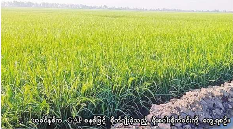
ယခင်နှစ်က GAP စနစ်ဖြင့် စိုက်ပျိုးခဲ့သည့် မိုးစပါးစိုက်ခင်းကို တွေ့ရစဉ်။

ပျိုးထုတ်လုပ်ရတဲ့ ရည်ရွယ်ချက်မှာ အစားအစာတွေဘေးအန္တရာယ်ကင်းရှင်းဖို့၊ ထုတ်ကုန်သီးနှံတွေ အရည်အသွေးကောင်းမွန်ဖို့၊ ပတ်ဝန်းကျင်ထိခိုက်မှုလျော့နည်းစေဖို့၊ လုပ်သားတွေရဲ့ ကျန်းမာရေးနဲ့ လူမှုဘဝသာယာဖို့အတွက် ဖြစ်ပါတယ်။ ဒါကြောင့် GAP စနစ်နဲ့ စိုက်ပျိုးရေးဆိုင်ရာအလေ့အကျင့်ကောင်းတွေကိုလိုက်နာပြီး စိုက်ပျိုးထုတ်လုပ်ကြဖို့ ဆောင်ရွက်နေတာဖြစ်ပါတယ်”ဟု ခရိုင်ဦးစီးမှူး ဦးလှမိုးက ပြောပြသည်။ ပြီးခဲ့သည့် မိုးရာသီက မိုးစပါးကို GAP စနစ်ဖြင့် ပွင့်ဖြူမြို့နယ်တွင် ကျေးရွာအုပ်စု ခုနစ်အုပ်စု၊ အစုအဖွဲ့ပေါင်း ၄၀၊ တောင်သူ ၉၂၇ ဦးက ဧက ၃၀၀၀ စိုက်ပျိုးနိုင်ခဲ့ပြီး စပါးတစ်ဧကလျှင် ၉၂ ဒသမ ၃ တင်းနှုန်းထွက်ရှိခဲ့ကြောင်း သိရသည်။ မိုးထက်(မင်းဘူး)