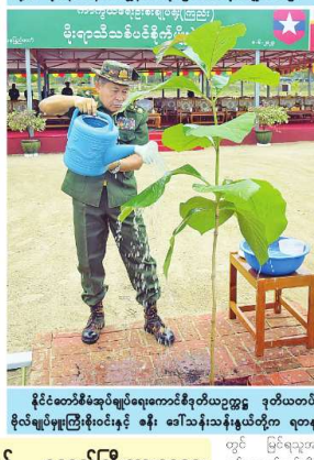
နိုင်ငံတော်စီမံအုပ်ချုပ်ရေးကောင်စီဥက္ကဋ္ဌ ဒုတိယတပ်မတော်ကာကွယ်ရေးဦးစီးချုပ် (ကြည်း) ဒုတိယ ခိုင်မျိုးဗိုလ်မှူးကြီးမောင်အောင်နှင့် ဓမ္မ၊ ဝေ၊ ကြည်းတပ်မှ တို့က ရတနာတန်းဝင်ကျွန်းပင်ကို စိုက်ပျိုးပေးစဉ်။

ဦးစွာ နိုင်ငံတော်စီမံအုပ်ချုပ်ရေးကောင်စီဥက္ကဋ္ဌ တပ်မတော်ကာကွယ်ရေးဦးစီးချုပ် ခိုင်မျိုးဗိုလ်မှူးကြီးမောင်အောင်နှင့် ၂၀၂၃ ခုနှစ် ကာကွယ်ရေးဦးစီးချုပ် (ကြည်း၊ ဓမ္မ၊ ဝေ) မိသားစုများ၏ ပထမအကြိမ် မိုးရာသီသစ်ပင်စိုက်ပျိုးပွဲအခမ်းအနားတွင် အများစုကားပြောပေးစဉ်။