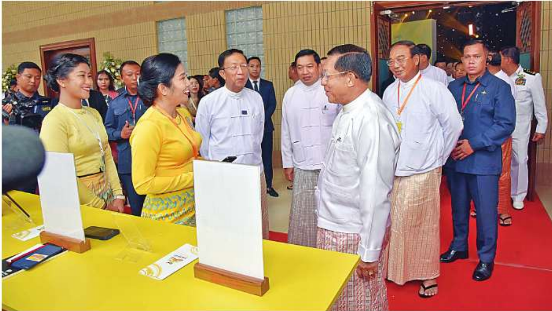
နိုင်ငံတော်စီမံအုပ်ချုပ်ရေးကောင်စီဥက္ကဋ္ဌ နိုင်ငံတော်ဝန်ကြီးချုပ် ဗိုလ်ချုပ်မှူးကြီးမင်းအောင်လှိုင်အား အောင်ဘာလေအဖွင့်သီချင်းသိန်းဆယ်စနစ် Mobile Application အသုံးပြုမှုကို တာဝန်ရှိသူများက ရှင်းလင်းတင်ပြစဉ်။

ထို့နောက် နိုင်ငံတော်စီမံအုပ်ချုပ်ရေးကောင်စီဥက္ကဋ္ဌ နိုင်ငံတော်ဝန်ကြီးချုပ်သည် အောင်ဘာလေ အဖွင့်သီချင်းသိန်းဆယ်စနစ် Mobile Application အသုံးပြုမှုကို ကြည့်ရှုရာ တာဝန်ရှိသူများက ရှင်းလင်းတင်ပြခဲ့ကြကြောင်း သတင်းရရှိသည်။