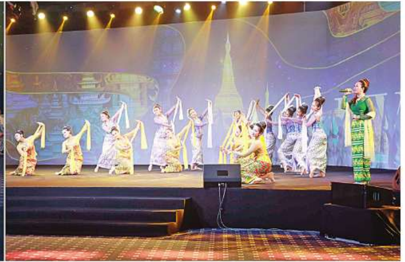
နိုင်ငံတော်စီမံအုပ်ချုပ်ရေးကောင်စီဥက္ကဋ္ဌ နိုင်ငံတော်ဝန်ကြီးချုပ် ဗိုလ်ချုပ်မှူးကြီးမင်းအောင်လှိုင်နှင့် အခမ်းအနားတက်ရောက်လာကြသူများက အောင်ဘာလေအဖွင့်သီချင်း "အောင်" တေးသီချင်းကို အဆိုအကများဖြင့်တင်ဆက်မှုအား ကြည့်ရှုအားပေးစဉ်။