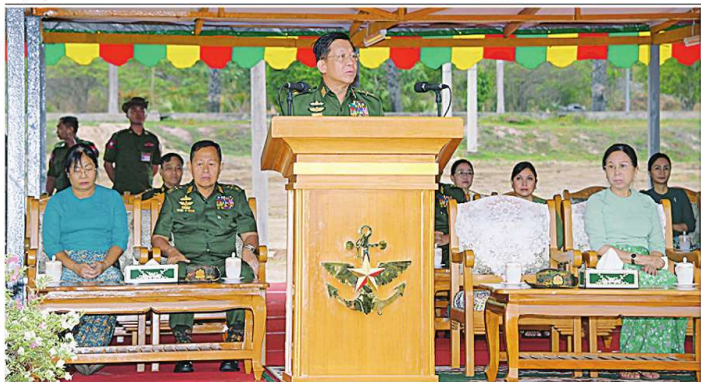
နိုင်ငံတော်စီမံအုပ်ချုပ်ရေးကောင်စီဥက္ကဋ္ဌ တပ်မတော်ကာကွယ်ရေးဦးစီးချုပ် ခိုင်မျိုးဗိုလ်မှူးကြီးမောင်အောင်နှင့် ၂၀၂၃ ခုနှစ် ကာကွယ်ရေးဦးစီးချုပ် (ကြည်း၊ ဓမ္မ၊ ဝေ) မိသားစုများ၏ ပထမအကြိမ် မိုးရာသီသစ်ပင်စိုက်ပျိုးပွဲအခမ်းအနားတွင် အများစုကားပြောပေးစဉ်။