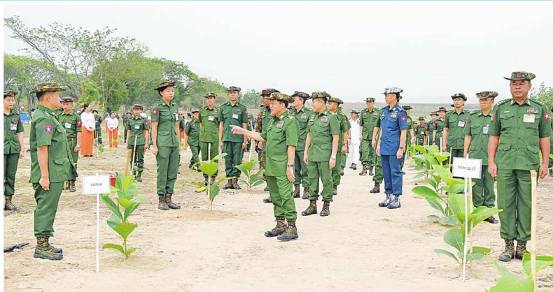
နိုင်ငံတော်စီမံအုပ်ချုပ်ရေးကောင်စီဥက္ကဋ္ဌ တပ်မတော်ကာကွယ်ရေးဦးစီးချုပ် ခိုင်မျိုးဗိုလ်မှူးကြီးမောင်အောင်နှင့် အရာရှိ စစ်သည်၊ မိသားစုများ၏ စုပေါင်းသစ်ပင်စိုက်ပျိုးပွဲအခမ်းအနားတွင် လှည့်လည်ကြည့်ရှုအားပေးစဉ်။

ရတနာတန်းဝင်ကျွန်းပင်စိုက်ပျိုးပွဲအခမ်းအနားတွင် အများစုကားပြောပေးစဉ်။