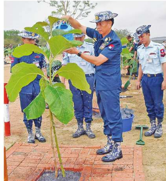
ကာကွယ်ရေးဦးစီးချုပ် (ဝေ) ခိုင်မျိုးဗိုလ်မှူးကြီးမောင်အောင် ရတနာတန်းဝင်ကျွန်းပင်ကို စိုက်ပျိုးပေးစဉ်။