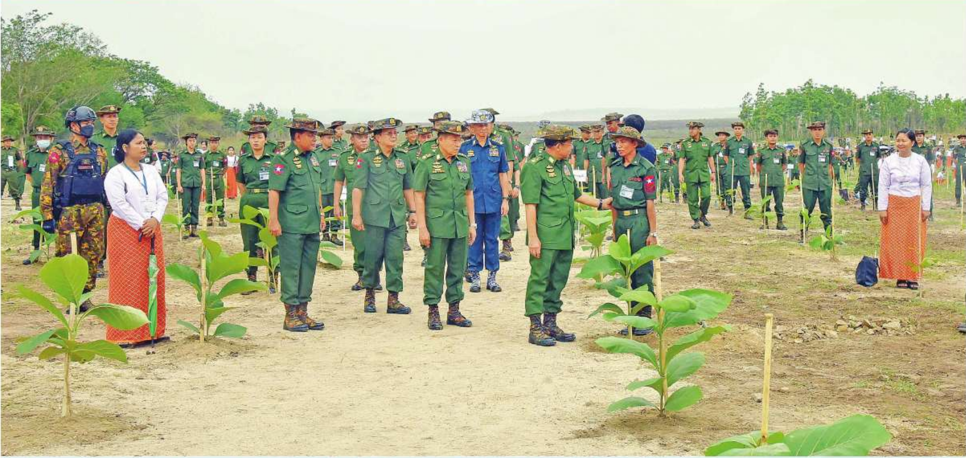
နိုင်ငံတော်စီမံအုပ်ချုပ်ရေးကောင်စီဥက္ကဋ္ဌ တပ်မတော်ကာကွယ်ရေးဦးစီးချုပ် ဗိုလ်ချုပ်မှူးကြီးမင်းအောင်လှိုင် အရာရှိ၊ စစ်သည်၊ မိသားစုများ၏ စုပေါင်းသစ်ပင်စိုက်ပျိုးနေမှုကို လှည့်လည်ကြည့်ရှုအားပေးစဉ်။

နေပြည်တော် ဇွန် ၈ အကူဖြစ်စေရန်၊ အရိပ်အာဝါသရရှိ ရည်ရွယ်၍ ကာကွယ်ရေးဦးစီးချုပ်ရုံး ၂၀၁၁ ခုနှစ်မှစ၍ နှစ်စဉ်မိုးရာသီ သန့်ရှင်းစင်ကြယ်စေရန်အတွက် တစ်ဖက် (ကြည်း၊ ရေ၊ လေ) မိသားစုများနှင့် တစ်အုပ်တစ်မ သစ်ပင်စိုက်ပျိုးပွဲများ ဦးစီးချုပ်ရုံး(ကြည်း၊ ရေ၊ လေ) မိသားစု နိုင်စေရန်နှင့် ရာသီဥတုကို အထောက်အကူဖြစ်စေရန် တိုင်းစစ်ဌာနချုပ် အသီးသီးတို့တွင် ကျင်းပပြုလုပ်လျက်ရှိသည်။ များ၏ စာမျက်နှာ ၁၆ ကော်လံ ၁ P။