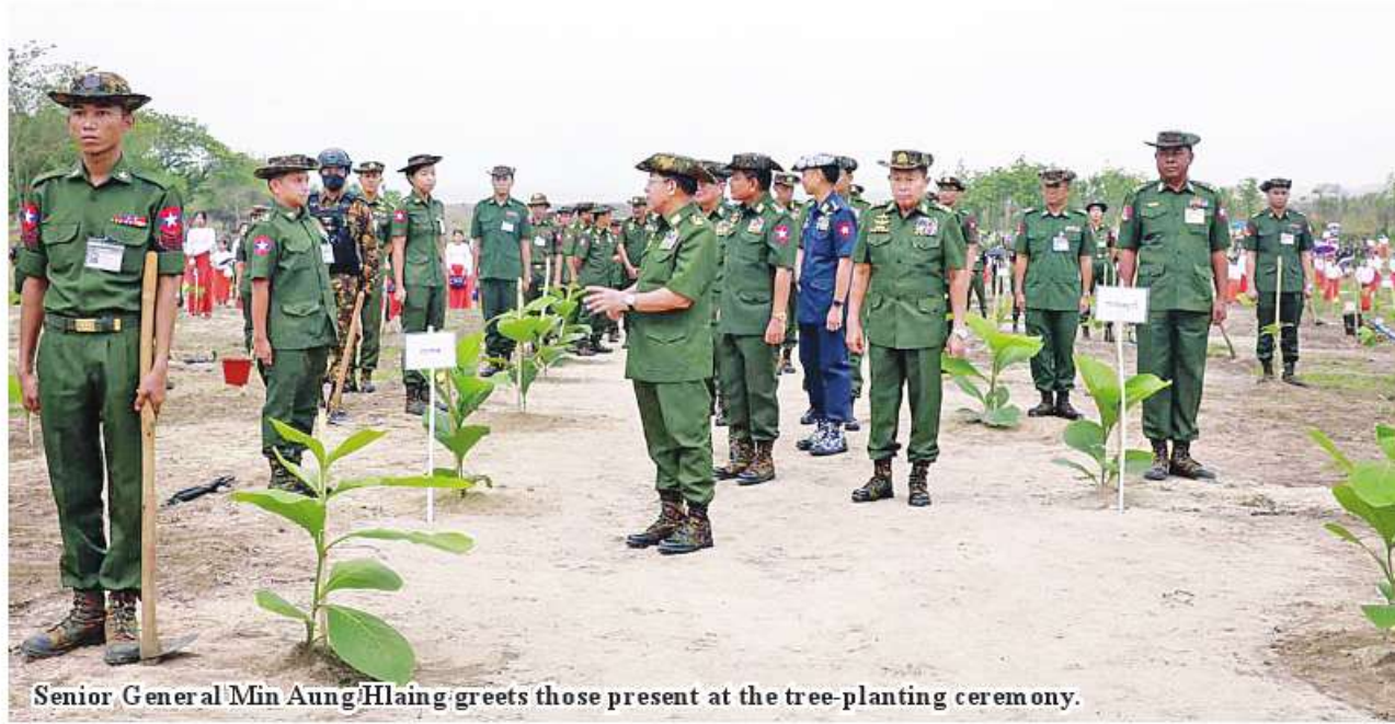
Senior General Min Aung Hlaing greets those present at the tree-planting ceremony.

Nay Pyi Taw June 8 Families of the Office of the Commander-in-Chief (Army, Navy and Air) and those from relevant military command have been holding the manageable-scale monsoon tree-growing ceremonies since 2011, aimed at conserving environment, contributing to easing impacts of climate change, give shade and supporting the State economy on one hand. Chairman of the State Administration Council Commander-in-Chief of Defence Services Senior General Min Aung Hlaing grew a teak tree at the first monsoon tree-growing ceremony of families of the Office of the Commander-in-Chief (Army, Navy and Air) near Yezin