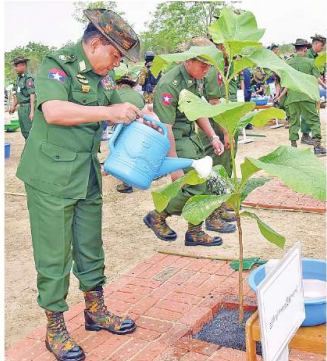
ညိုနှိုင်းကွပ်ကဲရေးမှူးကြီး (ကြည်း) ဓမ္မ၊ ဝေ) ခိုင်မျိုးဗိုလ်မှူးကြီးမောင်အောင်နှင့် ရတနာတန်းဝင်ကျွန်းပင်ကို စိုက်ပျိုးပေးစဉ်။