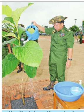
နိုင်ငံတော်စီမံအုပ်ချုပ်ရေးကောင်စီဥက္ကဋ္ဌ တပ်မတော်ကာကွယ်ရေးဦးစီးချုပ် ခိုင်မျိုးဗိုလ်မှူးကြီးမောင်အောင်နှင့် ဓမ္မ၊ ဝေ၊ ကြည်းတပ်မှ တို့က ရတနာတန်းဝင်ကျွန်းပင်ကို စိုက်ပျိုးပေးစဉ်။