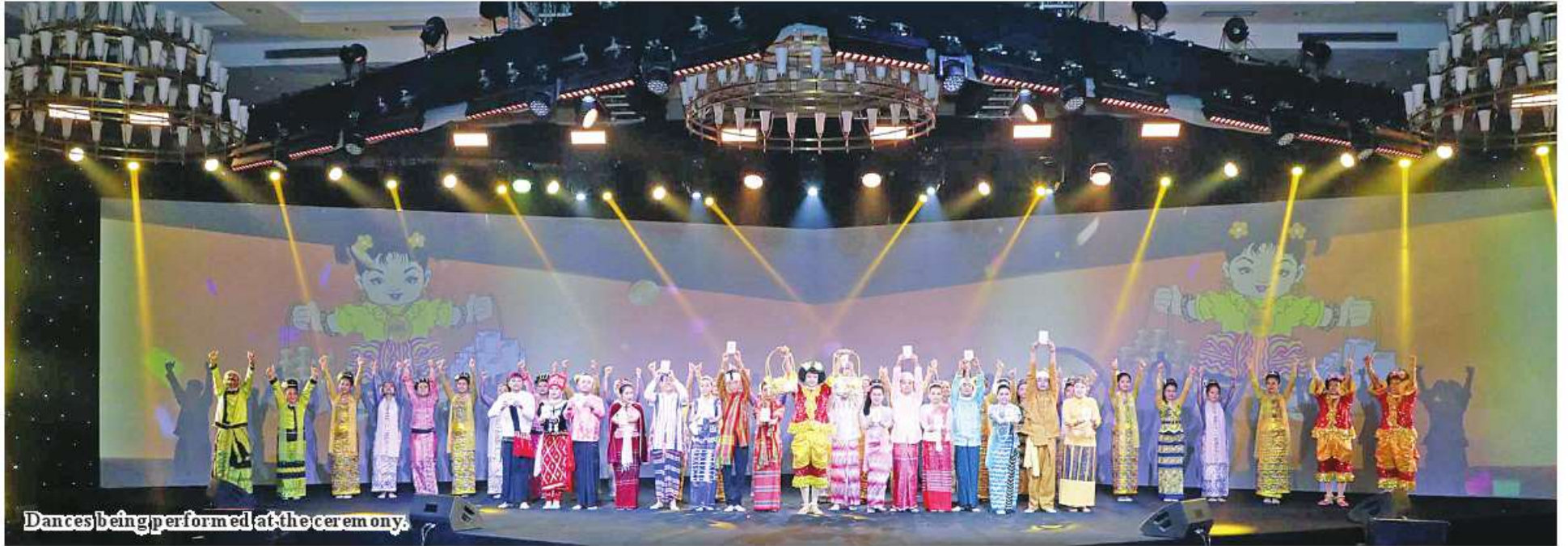
Dances being performed at the ceremony.