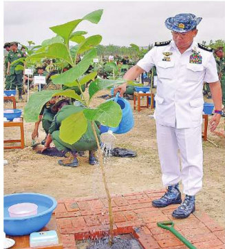
ကာကွယ်ရေးဦးစီးချုပ် (ဓမ္မ) ခိုင်မျိုးဗိုလ်မှူးကြီးမောင်အောင် ရတနာတန်းဝင်ကျွန်းပင်ကို စိုက်ပျိုးပေးစဉ်။