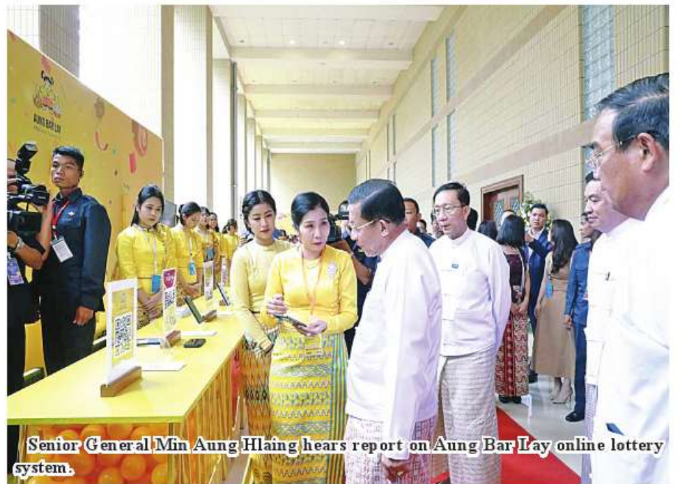
Senior General Min Aung Hlaing hears report on Aung Bar Lay online lottery system.