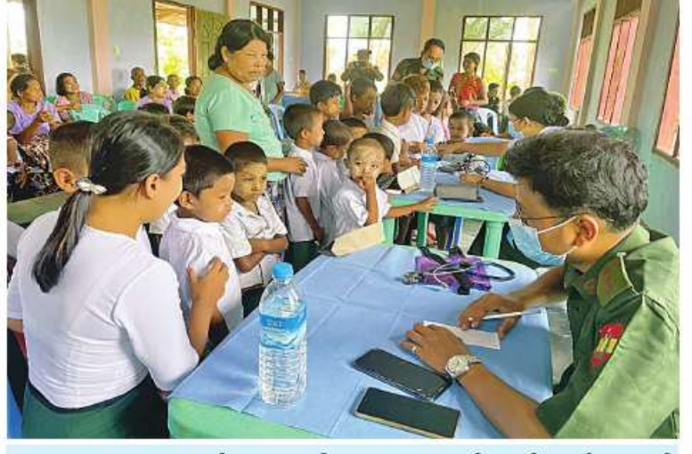
သဘာဝဘေးအန္တရာယ် ကျရောက်သောဒေသများတွင် တပ်မတော်မှ ကူညီကယ်ဆယ်ရေးအဖွဲ့များက ကျောင်းသား၊ ကျောင်းသူများကို ကျန်းမာရေးစောင့်ရှောက်မှုလုပ်ငန်းများဆောင်ရွက်ပေးစဉ်။

လေဘေးသင့်ပြည်သူများ၊ ပရဟိတကျောင်းသား၊ ကျောင်းသူများနှင့် ဆရာ၊ ဆရာမများအတွက် သောက်ရေသန့်များ ပေးဝေခြင်းနှင့် ဆေးကုသပေးခြင်းများ ဆောင်ရွက်ပေးပြီး အဆိုပါဘုရားကြီးရှိ ကျောင်းထိုင်ဆရာတော်အား ဆန်၊ ဆီ၊ ပဲ၊ ဆားများ ဆက်ကပ်လှူဒါန်းသည်။ ထို့အတူ စစ်တွေမြို့သို့ရောက်ရှိနေသော ကူညီကယ်ဆယ်ရေးအဖွဲ့များသည် စစ်တွေမြို့ ရေချမ်းပြင်ကျေးရွာကားလမ်းတစ်လျှောက်ရှိ လဲကျနေသော သစ်ပင်သစ်ကိုင်းကြီးများ ခုတ်ထွင်ရှင်းလင်းခြင်းနှင့် မယ်လီကုန်းကျေးရွာ၌ ဒေသခံပြည်သူများကို ကျန်းမာရေးစောင့်ရှောက်မှုလုပ်ငန်းများ ဆောင်ရွက်ပေးလျက်ရှိသည်။ အလားတူ မောင်တောမြို့နယ်သို့ရောက်ရှိနေသည့် ကူညီကယ်ဆယ်ရေးအဖွဲ့များသည် အင်းဒင်ကျေးရွာ၌ ဒေသခံပြည်သူများကို ကျန်းမာရေးစောင့်ရှောက်မှုလုပ်ငန်းများ ဆောင်ရွက်ပေးလျက်ရှိသည်။ ထို့ပြင် တပ်မတော်အကြီးအကဲ၏ လမ်းညွှန်မှုများအရ ကာကွယ်ရေးဦးစီးချုပ်