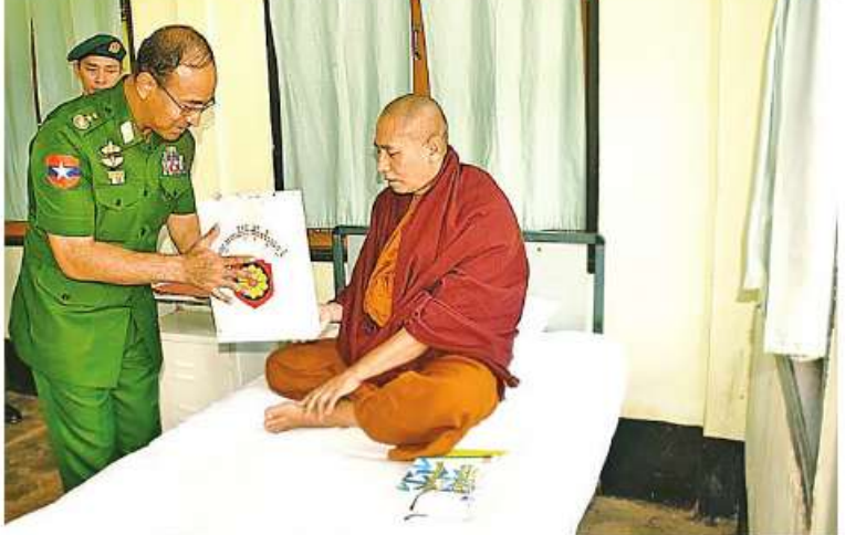
ကာကွယ်ရေးဦးစီးချုပ်ရုံး(ကြည်း)မှ ဒုတိယဗိုလ်ချုပ်ကြီးအောင်အောင် ဆေးရုံ တက်ရောက် ကုသမှုခံယူနေသောဆရာတော်အား အာဟာရဖြည့်စားသောက် ဖွယ်ရာများ ဆက်ကပ်လှူဒါန်းစဉ်။

နေပြည်တော် ဇွန် ၈ ရှမ်းပြည်နယ်(တောင်ပိုင်း) နမ့်စန်မြို့ရှိ တပ်မတော်သေးရုံး၌ တက်ရောက်ကုသမှု ခံယူလျက်ရှိသော သံယာတော်များ၊ အရာရှိ၊ စစ်သည်၊ မိသားစုဝင်များ၊ စစ်မှုထမ်း ဟောင်းအဖွဲ့ဝင်များနှင့် မိသားစုဝင်များ၊ ဒေသခံ တိုင်းရင်းသားပြည်သူများကို ယနေ့တွင် ကာကွယ်ရေးဦးစီးချုပ်ရုံး(ကြည်း) မှ ဒုတိယဗိုလ်ချုပ်ကြီးအောင်အောင်၊ အရှေ့အလယ်ပိုင်းတိုင်းစစ်ဌာနချုပ် တိုင်းမှူး ဝိုင်းဖူးချုပ်ကြည်ခိုင်နှင့် တာဝန်ရှိသူများက သွားရောက်ကြည့်ရှုသည်။ ဦးစွာ ကာကွယ်ရေးဦးစီးချုပ်ရုံး(ကြည်း) မှ ဒုတိယဗိုလ်ချုပ်ကြီးအောင်အောင်၊ တိုင်းမှူးနှင့် တာဝန်ရှိသူများက ဆေးရုံ တက်ရောက်ကုသလျက်ရှိသော သံယာ တော်များ၊ အရာရှိ၊ စစ်သည်၊ မိသားစုဝင် များ၊ စစ်မှုထမ်းဟောင်းအဖွဲ့ဝင်များနှင့် မိသားစုဝင်များ၊ ဒေသခံတိုင်းရင်းသား များ၏ တစ်ဦးချင်းရောဂါဖြစ်ပွားမှုအခြေ အနေနှင့် ရောဂါတိုးတက်ကောင်းမွန်လာ မှုအခြေအနေတို့ကို လိုက်လံကြည့်ရှု၍ အားပေးစကားများပြောကြားကာ အာဟာ ရဖြည့်စားသောက်ဖွယ်ရာများ အသီးသီး