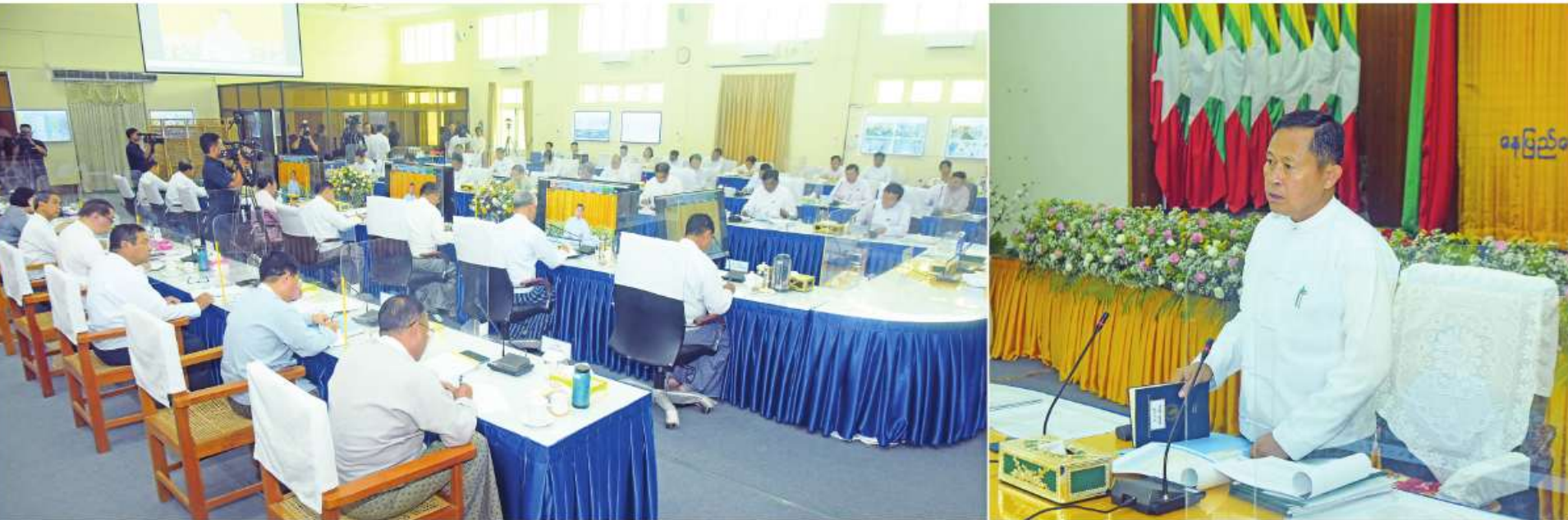
အသေးစား၊ အငယ်စားနှင့် အလတ်စားစီးပွားရေးလုပ်ငန်းများဖွံ့ဖြိုးတိုးတက်ရေးလုပ်ငန်းကော်မတီဥက္ကဋ္ဌ နိုင်ငံတော်စီမံအုပ်ချုပ်ရေးကောင်စီဒုတိယဥက္ကဋ္ဌ ဒုတိယဝန်ကြီးချုပ် ဒုတိယဗိုလ်ချုပ်မှူးကြီးစိုးဝင်း အသေးစား၊ အငယ်စားနှင့် အလတ်စားစီးပွားရေးလုပ်ငန်းများဖွံ့ဖြိုးတိုးတက်ရေးလုပ်ငန်းကော်မတီအစည်းအဝေး (၁/၂၀၂၃) တွင် အမှာစကားပြောကြားစဉ်။

နေပြည်တော် ဇွန် ၈ ကော်မတီအစည်းအဝေး (၁/၂၀၂၃) ကို ယနေ့ အငယ်စားနှင့် အလတ်စားစီးပွားရေးလုပ်ငန်းများ ဒုတိယဝန်ကြီးချုပ် ဒုတိယဗိုလ်ချုပ်မှူးကြီးစိုးဝင်း အသေးစား၊ အငယ်စားနှင့် အလတ်စားစီးပွားရေးလုပ်ငန်းများ ဖွံ့ဖြိုးတိုးတက်ရေးလုပ်ငန်းကော်မတီဥက္ကဋ္ဌ နိုင်ငံ တက်ရောက်အမှာစကားပြောကြားသည်။ ရေးလုပ်ငန်းများ ဖွံ့ဖြိုးတိုးတက်ရေးလုပ်ငန်း အစည်းအဝေးခန်းမ၌ ကျင်းပရာ အသေးစား၊ တော်စီမံအုပ်ချုပ်ရေးကောင်စီ ဒုတိယဥက္ကဋ္ဌ စာမျက်နှာ ၂၁ ကော်လံ ၁ ☆