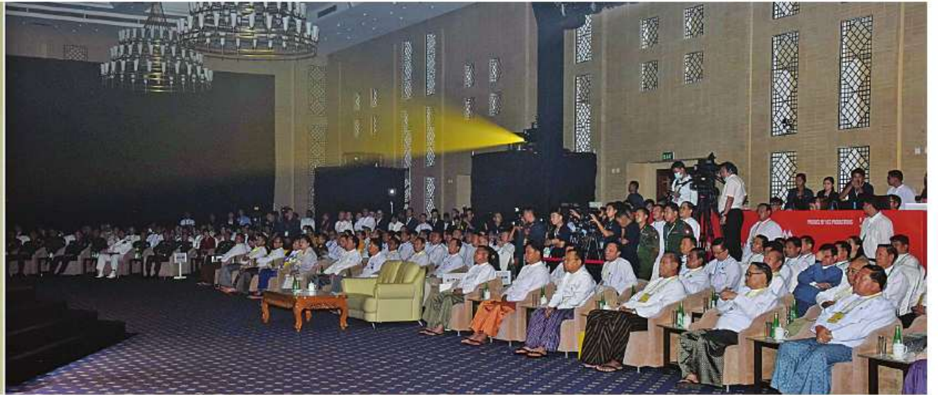
နိုင်ငံတော်စီမံအုပ်ချုပ်ရေးကောင်စီဥက္ကဋ္ဌ နိုင်ငံတော်ဝန်ကြီးချုပ် ဝိုင်းချုပ်မှူးကြီးမင်းအောင်လှိုင် အောင်ဘာလေအွန်လိုင်းသိန်းဆယ်စနစ်စတင်ခြင်း ဖွင့်ပွဲအခမ်းအနားတွင် အမှာစကားပြောကြားစဉ်။

နေပြည်တော် ၅ နံနက် ၈ အောင်ဘာလေအွန်လိုင်းသိန်းဆယ်စနစ် စတင်ခြင်း ဖွင့်ပွဲအခမ်းအနားကို ယနေ့ နံနက်ပိုင်းတွင် နေပြည်တော်ရှိ မြန်မာ အပြည်ပြည်ဆိုင်ရာ ကွန်ဗင်းရှင်းဗဟို ဌာန-၂ ၌ ကျင်းပရာ နိုင်ငံတော်စီမံ အုပ်ချုပ်ရေးကောင်စီဥက္ကဋ္ဌ နိုင်ငံတော် ဝန်ကြီးချုပ် ဝိုင်းချုပ်မှူးကြီးမင်းအောင်လှိုင် တက်ရောက် အမှာစကားပြောကြားသည်။ အခမ်းအနားသို့ နိုင်ငံတော်စီမံ အုပ်ချုပ်ရေးကောင်စီဥက္ကဋ္ဌ နိုင်ငံတော် ဝန်ကြီးချုပ်နှင့်အတူ ကောင်စီတွဲဖက် အတွင်းရေးမှူး ဒုတိယဝန်ကြီးကြီး ချစ်ဝင်းဦး၊ ကောင်စီဝင်များ၊ ပြည်ထောင်စု ဝန်ကြီးများနှင့် ပြည်ထောင်စုအဆင့်ပုဂ္ဂိုလ် များ၊ နေပြည်တော်ကောင်စီဥက္ကဋ္ဌ၊ ညှိနှိုင်း ကွပ်ကဲရေးမှူးကြီး(ကြည်းရေးလေ) ဝိုင်းချုပ်ကြီး မောင်မောင်အေး၊ ကာကွယ်ရေးဦးစီးချုပ်ရုံး မှ တပ်မတော်အရာရှိကြီးများ၊ မြန်မာစီးပွား ရေးကော်ပိုရေးရှင်းဥက္ကဋ္ဌ၊ ဝိယက်နမ် ဆိုရှယ်လစ်သမ္မတနိုင်ငံအစိုးရ ကာကွယ်ရေး ဝန်ကြီးဌာနကိုယ်စား Viettel Group မှ တာဝန်ရှိသူများ၊ နေပြည်တော်တိုင်းစစ်ဌာန ချုပ်တိုင်းမှူး၊ ဒုတိယဝန်ကြီးများ၊ ဖိတ်ကြား ထားသည့်နေပြည်တော်များ၊ အနုပညာရှင်