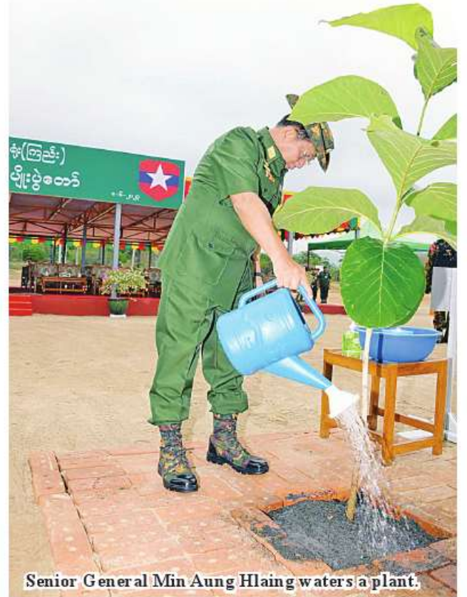
Senior General Min Aung Hlaing waters a plant.

families of Tatmadaw (Army, Navy and Air) planted 1,764 teak plants, 882 Manjansha plants and 882 gum-kino plants, totalling 3,528. Tatmadaw held 36 tree-growing ceremonies to plant 189,189 precious plants, perennial trees and windbreaks from 2011 to the first tree-growing ceremony in 2023. The whole Tatmadaw grew 210,398 trees the same day Relevant military command areas held monsoon tree-growing ceremonies in growing precious plants, industrial crops, perennial crops and windbreaks. Commanders and officials grew