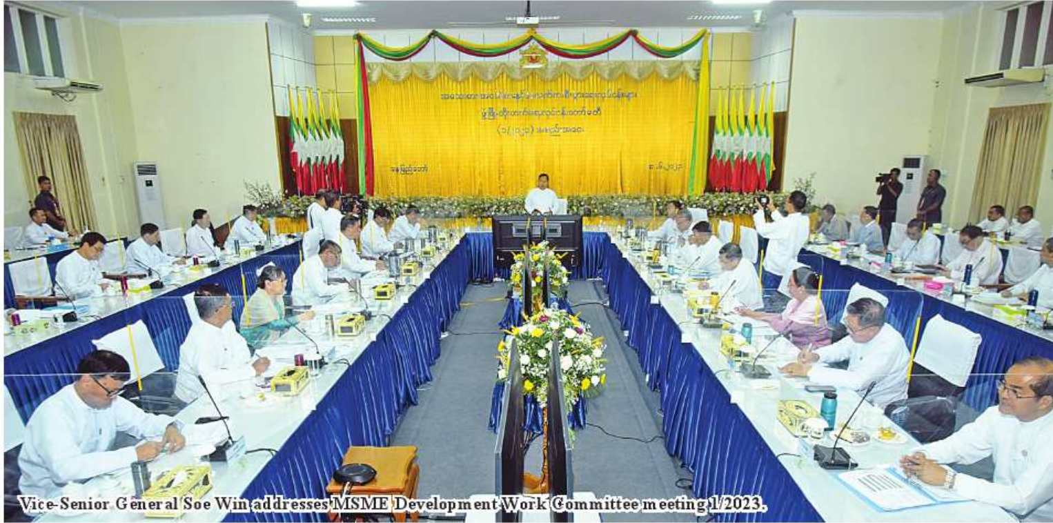
Vice-Senior General Soe Win addresses MSME Development Work Committee meeting 1/2023.

Nay Pyi Taw June 8 Meeting (1/2023) of the Work Committee for Development of Micro, Small and Medium Enterprise was held at the Ministry of Industry in Nay Pyi Taw this afternoon and Chairman of the Work Committee for Development of Micro, Small and Medium Enterprises Vice Chairman of the State Administration Council Deputy Prime Minister Vice-Senior General Soe Win delivered an address at the meeting.