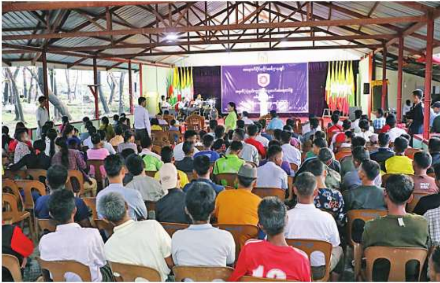
ရခိုင်ပြည်နယ်အတွင်း မိုခါမုန်တိုင်း တိုက်ခတ်သည့်ဒေသများတွင် ပြန်လည်ထူထောင်ရေးလုပ်ငန်းများ ဆောင်ရွက်လျက်ရှိသော နယ်မြေခံ တပ်မတော်သားများ၊ မြန်မာနိုင်ငံရဲတပ်ဖွဲ့ဝင်များ၊ မီးသတ်တပ်ဖွဲ့ဝင်များနှင့် မိသားစုဝင်များကို နယ်လှည့်ပြည်သူ့ဆက်ဆံရေးတပ်ခွဲမှ ကပြသီဆိုဖျော်ဖြေစဉ်။

နေပြည်တော် ၇ ဇူလိုင် - တိုက်ခတ်သည့်ဒေသများတွင် ပြန်လည်ထူထောင်ရေးလုပ်ငန်းများ ဆောင်ရွက်လျက်ရှိသော အနောက်ပိုင်းတိုင်းစစ်ဌာနချုပ် နယ်မြေခံတပ်မတော်သားများ၊ မြန်မာ