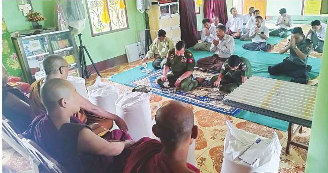
သာသနာ့အလင်းရောင်ဘုန်းတော်ကြီးကျောင်း ကျောင်းထိုင်ဆရာတော်ထံမှ ကာကွယ်ရေးဦးစီးချုပ်ရုံး(ကြည်း)မှ ဒုတိယဗိုလ်ချုပ်ကြီးအေးဝင်း လှူဒါန်းမှုအစုစုအတွက် ရေစက်ချအမျှပေးဝေစဉ်။

ထို့အတူ ရခိုင်ပြည်နယ် မြေပုံမြို့သို့ ရောက်ရှိနေသော ဗိုလ်မှူးချုပ်ကျော်ကျော်စိုးသည် ရခိုင်ပြည်နယ်အစိုးရအဖွဲ့၏ သဘာဝဘေး ပြန်လည်ထူထောင်ရေးကော်မတီနှင့် အလှူရှင်များထောက်ပံ့သည့် ကုလားတန်(၅)သင်္ဘောဖြင့် ထပ်မံရောက်ရှိလာသည့် ထောက်ပံ့ပစ္စည်း ခြောက်မျိုးကို ယနေ့နံနက်ပိုင်းတွင် ငှက်ပင်လယ်ဆိပ်ကမ်း ဆိပ်ခံတံတားပေါ်သို့တင်ယူပြီး မြို့နယ်အထွေထွေအုပ်ချုပ်ရေးဦးစီးဌာန အစည်းအဝေးခန်းမသို့ပြောင်းရွှေ့ပေးကာ ထောက်ပံ့ရေးပစ္စည်းများ လေဘေးသင့်ပြည်သူများထံသို့ မြန်မြန်ဆန်ဆန်ဖြန့်ဝေပေးနိုင်ရေး အစည်းအဝေးပြုလုပ်ပြီး သက်ဆိုင်ရာတာဝန်ရှိသူများက ပူးပေါင်းဆောင်ရွက်ပေးလျက်ရှိကြောင်း သတင်းရရှိသည်။