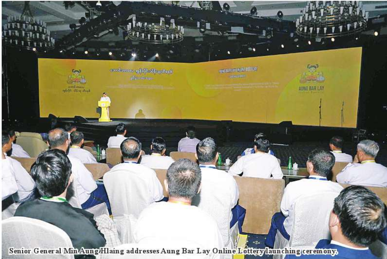
Senior General Min Aung Hlaing addresses Aung Bar Lay Online Lottery launching ceremony.