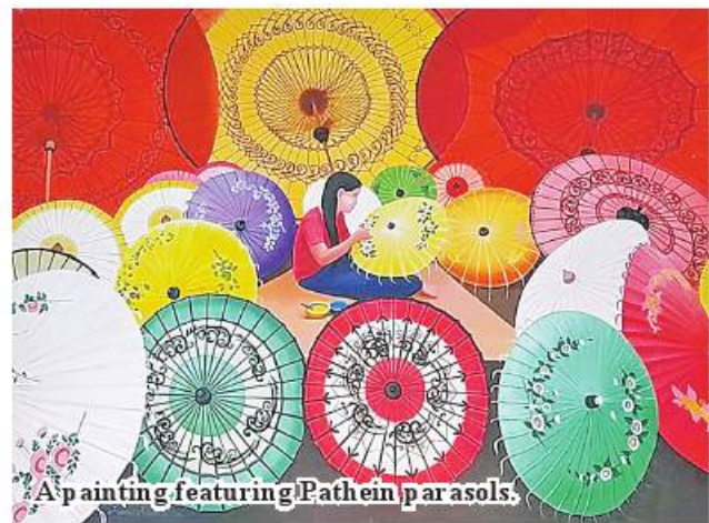
A painting featuring Parathin par asols.

are valued at ranging from K500,000 to K2 million. The artists created their works in water colour, oil colour, acrylics and sketch. ASH