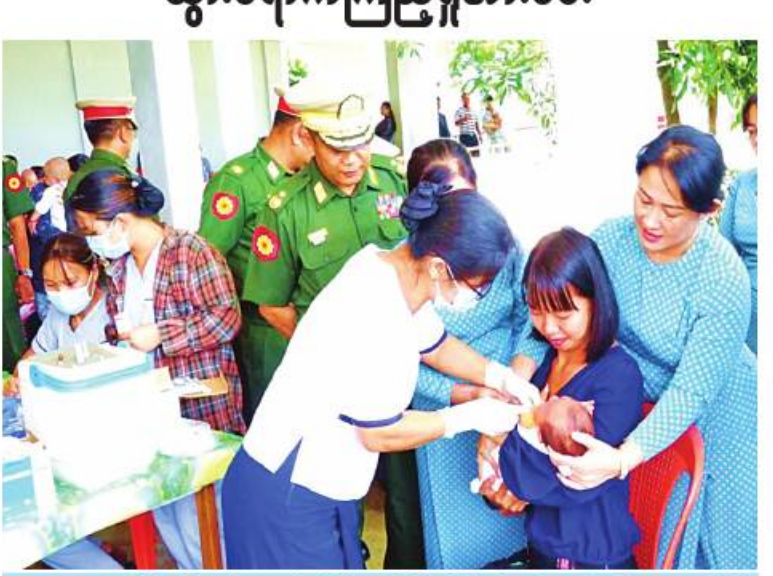
အရှေ့အလယ်ပိုင်းတိုင်းစစ်ဌာနချုပ် တိုင်းမှူး ဗိုလ်ချုပ်မျိုးမင်းထွန်း နယ်မြေခံဆေးတပ်ရင်း၌ အသက်နှစ်နှစ်အောက်ကလေးငယ်များ ငါးမျိုးစပ်ကာကွယ်ဆေးများ ထိုးနှံနေမှုအခြေအနေများကို ကြည့်ရှုအားပေးစဉ်။

နေပြည်တော် ၈ နို ၂ ရှမ်းပြည်နယ်(မြောက်ပိုင်း) လားရှိုးမြို့ရှိ တပ်မတော်ဆေးရုံ၊ ရှမ်းပြည်နယ်(တောင်ပိုင်း) ဒိုလမ်မြို့ရှိ နယ်မြေခံဆေးတပ်ရင်း၊ ဧရာဝတီတိုင်းဒေသကြီး ပုသိမ်မြို့ရှိ နယ်မြေခံဆေးတပ်ရင်းနှင့် ပဲခူးတိုင်းဒေသကြီး တောင်ငူမြို့ရှိ တပ်မတော်ဆေးရုံတို့၌ တက်ရောက်ဆေးကုသမှုခံယူနေသော သံဃာတော်များ၊ အရာရှိ၊ စစ်သည်၊ မိသားစုများ၊ စစ်မှုထမ်းဟောင်းအဖွဲ့ဝင်များ၊ ပြည်သူ့စစ်(ဌာန)တပ်ဖွဲ့ဝင်များနှင့် ဒေသပြည်သူများကို ယနေ့တွင် သက်ဆိုင်ရာ