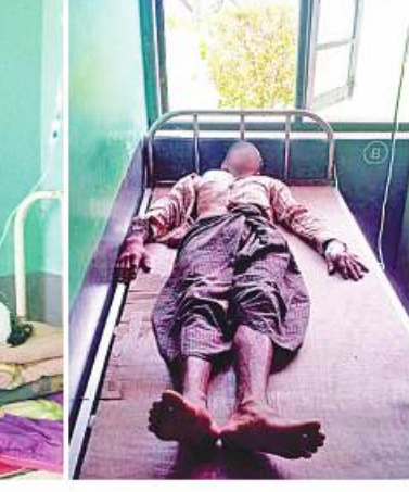
KNLA တပ်မဟာ(၆)မှ အကြမ်းဖက်မှုကိုလိုလားသူများနှင့် PDF အမည်ခံအကြမ်းဖက်သမားများက လက်နက်ကြီး၊ လက်နက်ငယ်များ၊ Drop Bomb များဖြင့် လာရောက်ပစ်ခတ်တိုက်ခိုက်မှုကြောင့် ထိခိုက်ဒဏ်ရာရရှိခဲ့သူများ ဖုတ်တမ်းဓာတ်ပုံ။

ထိုသို့ အပြစ်မဲ့အရပ်သားပြည်သူများ နေထိုင်ရာမြို့အတွင်းသို့ လက်နက်ကြီး၊ လက်နက်ငယ်များဖြင့် ပစ်ခတ်တိုက်ခိုက်ပြီး Drop Bomb များဖြင့် ချမှတ်ခဲ့သည့်အကြမ်းဖက် သမားများကို ဖမ်းဆီးအရေးယူနိုင်ရေးနှင့် နယ်မြေဒေသတည်ငြိမ်အေးချမ်းရေးအတွက် လုံခြုံရေးတပ်ဖွဲ့ဝင်များက လိုအပ်သည့် လုံခြုံရေးလုပ်ငန်းများ ဆက်လက်ဆောင်ရွက်လျက်ရှိကြောင်း သတင်းရရှိသည်။