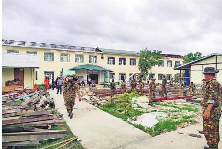
သာသနာ့အန္တရာယ်ကျရောက်ခဲ့သောဒေသများတွင် တပ်မတော်မှကူညီကယ်ဆယ်ရေးအဖွဲ့များက ကူညီကယ်ဆယ်ရေးနှင့်ပြန်လည်ထူထောင်ရေးလုပ်ငန်းများ ဆောင်ရွက်ပေးစဉ်။