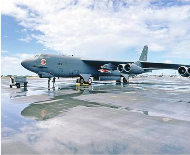
အမေရိကန်လေတပ် (USAF) သည် Quick Strike Extended Range (QS-တာဝိုင်ရီ၊ Kauai ကမ်းလွန်တွင် ER) B-52 Stratofortress ပုံးကြဲ

လေယာဉ်ကို တာဝေးပစ် ပွဲထိန်းပင်လယ် ပြင်မိုင်းများ တပ်ဆင်စမ်းသပ်ပွဲသန်းခဲ့ ကြောင်း မေ ၃၁ ရက်က The Defense Post တွင် ရေးသားဖော်ပြခဲ့သည်။