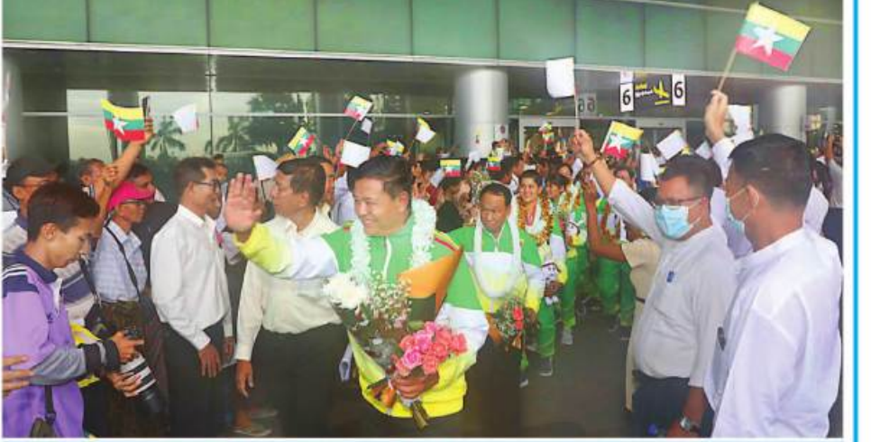
ရန်ကုန်မြို့သို့ ပြန်လည်ရောက်ရှိလာသော (၃၂)ကြိမ်မြောက် အရှေ့တောင်အာရှအားကစားပြိုင်ပွဲဝင်အားကစား သမားများအား တာဝန်ရှိသူများနှင့်ပြည်သူများက သောင်းသောင်းဖြူရက်ကြိုဆိုစဉ်။

၁၀၀၊ အသင်းလိုက်ပြိုင်ပွဲများတွင် ရွှေရ ပါက တစ်ဦးလျှင် ကျပ်သိန်း ၁၀၀၊ ငွေရပါကကျပ်သိန်း ၇၀၊ ကြေးရပါက ကျပ် ၃၅ သိန်း၊ နည်းပြ/အုပ်ချုပ်သူများအတွက်မူ ရွှေရပါက ကျပ်သိန်း ၁၀၀၊ ငွေရပါက ကျပ်သိန်း ၅၀၊ ကြေးရပါက ကျပ်သိန်း ၃၀ သိန်း စသည် ဖြင့် အသီးသီးချီးမြှင့်ခံကြရသည်။ ဗိုလ်လုပွဲ နှိမ့်ခဲ့သည့် မြန်မာအမျိုးသမီးဘောလုံး အသင်းဆိုလျှင် အမေရိကန်ဒေါ်လာ ၅၀၀၀၀၊ အကြံဉာဏ်လှပွဲအထိတက်ရောက် နိုင်ခဲ့သည့် အမျိုးသားဘောလုံးအသင်း ကတော့ ဒေါ်လာ ၂၀၀၀၀ စသည်ဖြင့် ထိုက်ထိုက်တန်တန် ချီးမြှင့်ခံခဲ့ရသည့် သတင်းများကား မိဘပြည်သူများအတွက် ဝမ်းမြောက်ဂုဏ်ယူဖွယ်ရာများပင်ဖြစ်သည်။ ဆုကြေးငွေများအနေဖြင့် စုစုပေါင်းငွေ ကျပ် ၃၃၃၃ သိန်း၊ အမေရိကန်ဒေါ်လာ ၇၀၀၀၀ ဟူသော ပမာဏမှာ ချီးမြှင့်မှု သမိုင်းတစ်လျှောက် များပြားသော ပမာဏ တစ်ခုဖြစ်သည်။ ယခုတစ်ကြိမ် ချီးမြှင့်မှုပုံစံ သည် အားကစားသမားများ၏ ရေရှည် ဘဝအာမခံချက်အတွက်လည်း တစ်ပိုင်း တစ်စဖြည့်ဆည်းရာရောက်သည်ဟု ဆိုချင် သည်။ ဥပမာ... အားကစားသမားတစ်ဦးရရှိ သည့် ချီးမြှင့်ငွေ သိန်း ၃၀၀ ဆိုပါစို့ တစ်လ ငါးသိန်းသုံးသွားမည်ဆိုလျှင် လပေါင်း ၆၀၊