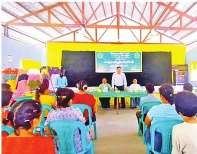
ကျော်စောဦး(မောရမ်းမြေ)

ထို့နောက် ဗန်းမော်ခရိုင် ကျေးလက်ဒေသဖွံ့ဖြိုးတိုးတက်ရေးဦးစီးဌာန ခရိုင်ဦးစီးမှူးနှင့် တာဝန်ရှိသူများသည် သင်တန်းသူများချုပ်လုပ်ထားသော အဝတ်အထည်များကို လှည့်လည်ကြည့်ရှုကြသည်။ အဆိုပါအသက်မွေးဝမ်းကျောင်းအထောက်အကူပြုအခြေခံစက်ချုပ်သင်တန်းသို့ မံစီမြို့နယ်အတွင်းရှိ ကျေးရွာများမှ သင်တန်းသူ ၁၅ ဦး တက်ရောက်ကြပြီး သင်တန်းတွင် အဝတ်အထည်အမျိုးမျိုး ချုပ်လုပ်နည်းကို ကျွမ်းကျင်နည်းပြများက မေ့ရက်မှ ၃၁ ရက်ထိ ရက် ၃၀ ကြာ စာတွေ့၊ လက်တွေ့ဖြင့် အာမေဍသင်ကြား ပို့ချပေးခဲ့ကြောင်း သိရသည်။