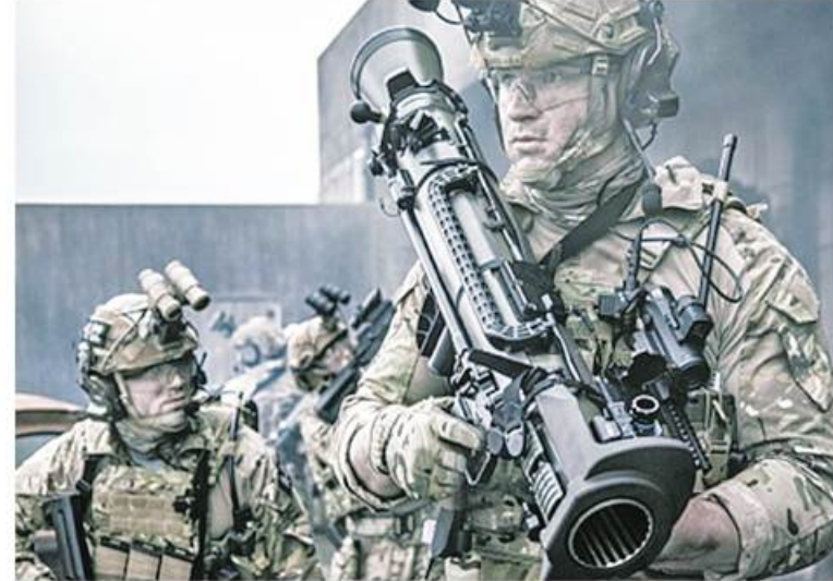
ဖြစ်ကြောင်း သိရသည်။ Sweden Orders Carl-Gustaf

ဆွီဒင်နိုင်ငံသည် ဖင်လန်နိုင်ငံ၏ NATO သို့ ဝင်ရောက်မှုအတိုင်း လိုက်ပါ လုပ်ဆောင်နိုင်ရန် မျှော်လင့်ထားပြီး ၎င်း လုပ်ဆောင်သည့် နည်းလမ်းများမှာအဖွဲ့ အစည်းကို လုံလောက်သောပံ့ပိုးမှုပေး နိုင်ကြောင်းပြသရန်ရည်ရွယ်နေခြင်းလည်း