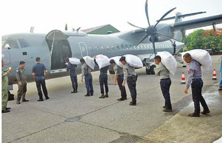
ဆိုင်ကလုန်းမုန်တိုင်း(မိခါ)တိုက်ခတ်မှုကြောင့် သဘာဝဘေးဒဏ်သင့်ဒေသများရှိ ပြည်သူများအတွက် ထောက်ပံ့ရေးပစ္စည်းများကို တပ်မတော်(လေ)မှ လေယာဉ်၊ ရဟတ်ယာဉ်များဖြင့် ဆက်လက်ပို့ဆောင်ပေးစဉ်။

သည့်ပစ္စည်းများကိုလည်း တပ်မတော်လေယာဉ်၊ ရဟတ်ယာဉ်များဖြင့် ကူညီပို့ဆောင်ပေးလျက်ရှိသည်။ ထိုသို့ပို့ဆောင်ပေးလျက်ရှိရာ ယနေ့တွင် သဘာဝဘေးဒဏ်သင့်ဒေသများရှိ စာသင်ကျောင်းများအတွက် ကျောင်းစိမ်းဝတ်စုံများ၊ ကျောင်းစာအုပ်များ၊ ဗလာစာအုပ်များ၊ တပ်မတော်(ကြည်း၊ရေလေ)မိသားစုများ၊ စေတနာရှင်အလှူရှင်များက လှူဒါန်းသည့် ဘုန်းကြီးကျောင်းနှင့်သီလရှင်ကျောင်းများအတွက် လှူဖွယ်ပစ္စည်းများ၊ အခြေခံ