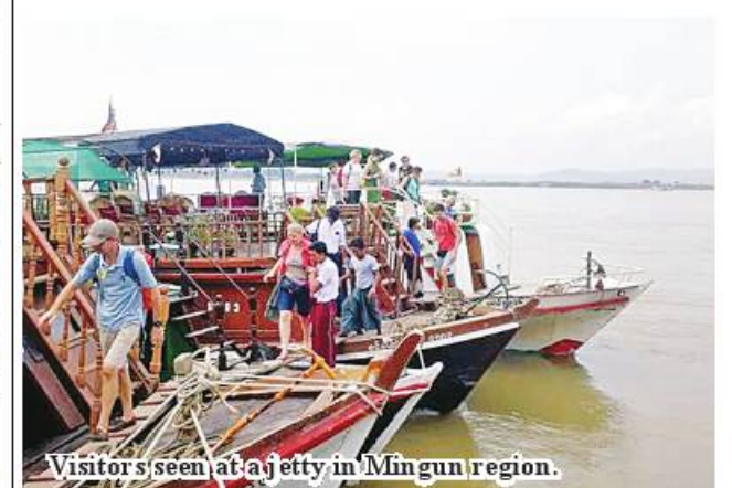
Visitors seen at a jetty in Mingun region.

More than 200 vessels dock at Mayanchan port of Mandalay to transport passengers as well as rice, cooking oil, salt, fish-paste, dried fish and other groceries. 184