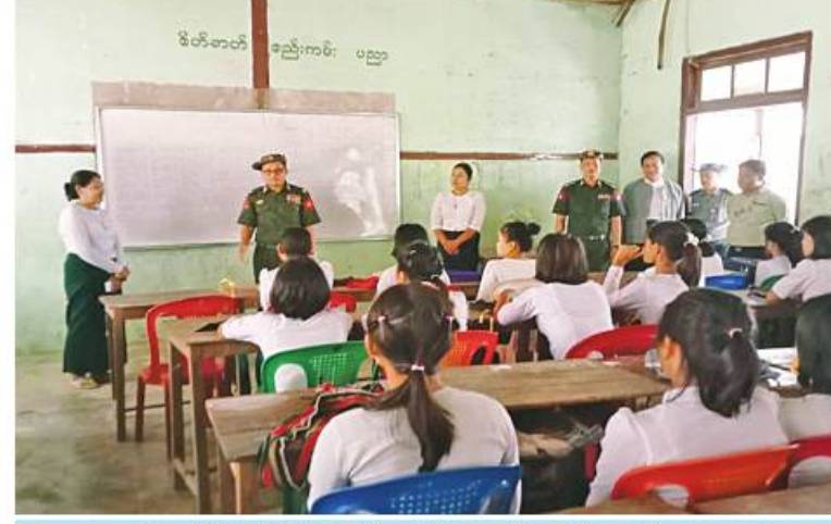
ကာကွယ်ရေးဦးစီးချုပ်ရုံး(ကြည်း)မှ ဗိုလ်မှူးချုပ်နေဝင်းအောင် ကျောင်းသား၊ ကျောင်းသူများ ပညာသင်ကြားနေမှုကို ကြည့်ရှုအားပေးစဉ်။

ယင်းသို့ ဆောင်ရွက်ပေးနေမှုများကို ပြည်ထောင်စုဝန်ကြီးများ၊ သက်ဆိုင်ရာ တိုင်းဒေသကြီးနှင့် ပြည်နယ်များမှ ဝန်ကြီးချုပ်များ၊ ကာကွယ်ရေးဦးစီးချုပ်ရုံး (ကြည်း)မှ တပ်မတော်အရာရှိကြီးများ၊ တိုင်းစစ်ဌာနချုပ်များမှ တာဝန်ရှိသူများ၊ ဌာနဆိုင်ရာတာဝန်ရှိသူများက သွားရောက် ကြည့်ရှုအားပေးကြပြီး ဆရာ၊ ဆရာမများနှင့် ကျောင်းသား၊ ကျောင်းသူများကို ရင်းရင်းနှီးနှီးအားပေးစကားများပြောကြားခဲ့ကြကြောင်း သတင်းရရှိသည်။