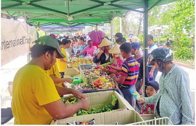
နယ်မြေခံ တပ်မတော်သားများနှင့် တာဝန်ရှိသူများက စစ်တွေမြို့ရှိ မုန်တိုင်းဒဏ်သင့်ပြည်သူများကို ဆန်၊ ဆီ၊ ဆား၊ ကြက်ဥ၊ ဟင်းသီးဟင်းရွက်များနှင့် စားသောက်ကုန်ပစ္စည်းများကို ဈေးနှုန်းသက်သာစွာဖြင့် ရောင်းချပေးစဉ်။

များ၊ ဟင်းသီးဟင်းရွက်များ၊ ကြက်သွန်နီ၊ ကြက်သွန်ဖြူနှင့် တပ်မတော်စက်ရုံများနှင့် မြန်မာစီးပွားရေးကော်ပိုရေးရှင်းတို့မှ ထုတ်လုပ်သည့် ခေါက်ဆွဲခြောက်၊ ဘီစကွတ်နှင့်စည်သွတ်ဘူးများဖြစ်သည့် အမဲသားဘူး၊ မျှစ်စားတော်ပဲဘူး၊ ကြက်သားအားလူးဘူး၊ ငါးတန်အချိုပေါင်းဘူး၊ ငါးသလောက်ဘူး၊ ငါးပိကြော်ဘူး၊ ပဲထောပတ်ဘူး၊ ပဲခရမ်းဘူး၊ သရက်သီးသနပ်ဘူး စသည့် စားသောက်ကုန်ပစ္စည်းများ၊ ပုဂ္ဂလိကလုပ်ငန်းရှင်များ၏ စားကုန်ပစ္စည်းများ၊ လျှပ်စစ်ပစ္စည်းများနှင့် အိမ်ဆောက်ပစ္စည်းများကို ပြင်ပပေါက်ဈေးထက်သာစွာဈေးနှုန်းများဖြင့်ရောင်းချပေး