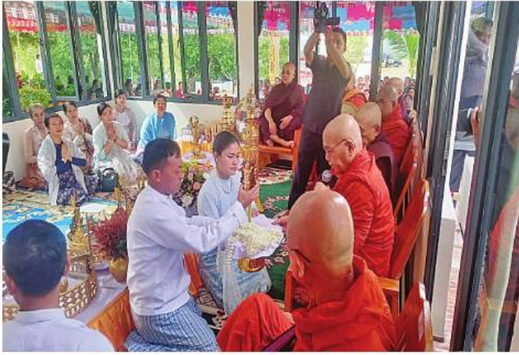
နိုင်ငံတော် သံဃမဟာနာယကအဖွဲ့ဝင် အဂ္ဂမဟာဂန္ထဝါစကပဏ္ဍိတ အတုလရန်အောင်ကျောင်းဆရာတော် ဘဒ္ဒန္တကောသလထံ အရှေ့တောင်တိုင်းစစ်ဌာနချုပ် တိုင်းမှူး ဝိုင်းမျိုးချုပ်စိုးမင်း၊ ဝန်ကြီးချုပ် ဝိုင်းမျိုးချုပ်စိုးမင်းနှင့် အလှူရှင်များ တက်ရောက်တော်မူပြီး နေပြည်တော်၌ အရှေ့တောင်တိုင်းစစ်ဌာနချုပ်၌ တည်ထားကိုးကွယ်အပ်သော ဇေယျအေးစေတီမြတ်ကြီးကို ရွှေသင်္ကန်းကပ်လှူခြင်း၊ ရွှေထီးတော်အသစ် ပြန်လည်တင်လှူပူဇော်ခြင်းအောင်ပွဲနှင့် ဗုဒ္ဓါဘိသေကအနေကဇာတင်မင်္ဂလာအခမ်းအနားကျင်းပ

နေပြည်တော် ဇွန် ၂ အရှေ့တောင်တိုင်းစစ်ဌာနချုပ်၌ တည်ထားကိုးကွယ်အပ်သော ဇေယျအေးစေတီမြတ်ကြီးကို ရွှေသင်္ကန်းကပ်လှူခြင်း၊ ရွှေထီးတော်အသစ် ပြန်လည်တင်လှူပူဇော်ခြင်းအောင်ပွဲနှင့် ဗုဒ္ဓါဘိသေက အနေကဇာတင်မင်္ဂလာအခမ်းအနားကို ယနေ့နံနက်ပိုင်းတွင် အဆိုပါစေတီမြတ်ကြီး ရင်ပြင်တော်ပေါ်၌ပြုလုပ်ရာ နိုင်ငံတော် သံဃမဟာနာယကအဖွဲ့ဝင် အဂ္ဂမဟာဂန္ထဝါစကပဏ္ဍိတ အတုလရန်အောင်ကျောင်းဆရာတော် ဘဒ္ဒန္တကောသလ အမျိုးပြုသော ဆရာတော်၊ သံဃာတော်များ ကြွရောက်တော်မူပြီး မွန်ပြည်နယ် ဝန်ကြီးချုပ် ဦးအောင်ကြည်သိန်း၊ အရှေ့တောင်တိုင်းစစ်ဌာနချုပ် တိုင်းမှူး ဝိုင်းမျိုးချုပ်စိုးမင်း၊ ပြည်နယ်ဝန်ကြီးများ၊ အရာရှိ၊ စစ်သည်၊ မိသားစုများ၊ အလှူရှင်များနှင့် ဧည့်ပရိသတ်များ တက်ရောက်ကြသည်။