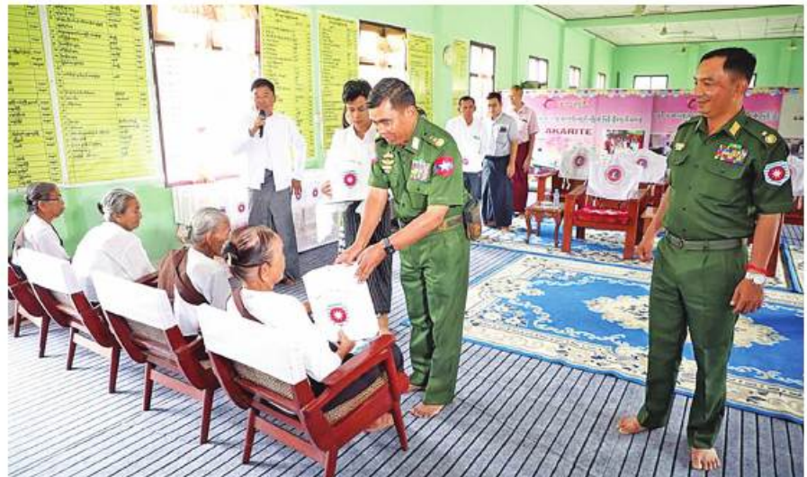
ကာကွယ်ရေးဦးစီးချုပ်ရုံး (ကြည်း)မှ ဒုတိယဗိုလ်ချုပ်ကြီး ဖုန်းမြတ် ဘိုးဘွားရိပ်သာရှိ အဘိုးအဘွားများကို စားသောက်ဖွယ်ရာများ၊ တိုင်းရင်းဆေးဝါးများနှင့် အလှူငွေများ ပေးအပ်လှူဒါန်းစဉ်။

နိုင်ငံရဲတပ်ဖွဲ့ဝင်များ၊ မီးသတ်တပ်ဖွဲ့ဝင်များ၊ ဌာနဆိုင်ရာဝန်ထမ်းများနှင့် စေတနာ့ဝန်ထမ်းတို့ပူးပေါင်း၍ ဖယ်ရှားရှင်းလင်းခြင်းလုပ်ငန်းများ၊ ပြန်လည်ထူထောင်ရေးလုပ်ငန်း ဆောင်ရွက်ခဲ့မှုအခြေအနေများနှင့်ပတ်သက်၍ ရှင်းလင်းတင်ပြသည်။ ထို့နောက် ဒုတိယဗိုလ်ချုပ်ကြီးဖုန်းမြတ်နှင့် အဖွဲ့ဝင်များက အဘိုးအဘွား ၃၉ ဦးတို့ကို စားသောက်ဖွယ်ရာများ၊ တိုင်းရင်းဆေးဝါးများနှင့်ထောက်ပံ့ငွေများကို ပေးအပ်လှူဒါန်းရာ အဘိုးအဘွားများက ဆုတောင်းမေတ္တာစကား ပြန်လည်ပြောကြားသည်။ ထို့ပြင် စစ်တွေတပ်နယ်မှနယ်မြေခံဆေးကုသရေးအဖွဲ့က အထွေထွေရောဂါများနှင့် ပတ်သက်၍ ရောဂါရှာဖွေစမ်းသပ်ခြင်းများ ဆောင်ရွက်ပေးနေမှုများကို ကြည့်ရှုအားပေးကာ မြန်မာနိုင်ငံလိုင်စင်ရ ကန်ထရိုက်တာများ အသင်းချုပ်(MLCA)က ချက်ပြုတ်လှူဒါန်းသည့် ခံပေါက်ထမင်း၊ ဟင်းလျာဘူးများကို အဘိုးအဘွားများနှင့် ရိပ်သာ