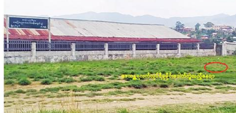
CRPH ၊ NUG အကြမ်းဖက်အဖွဲ့၏ လက်ဝေခံ PDF အမည်ခံအကြမ်းဖက်သမားများက တီးတိန်မြို့ရှိ အခြေခံပညာအထက်တန်းကျောင်း(ခွဲ)(မြို့မ)ကို လက်လုပ်ရီမုမိုင်းဖြင့် မိုင်းထောင်ဖောက်ခွဲမှုဖုတ်တမ်းဓာတ်ပုံ။

ဖောက်ခွဲခဲ့ကြောင်း၊ မိုင်းပေါက်ကွဲမှုကြောင့် ကျောင်းအဆောက်အအုံနှင့် ကျောင်းသား၊ ကျောင်းသူများ ပျက်စီးထိခိုက်ဒဏ်ရာရရှိမှု မရှိကြောင်းနှင့် အဆိုပါကျောင်းတွင် ဆရာ၊ ဆရာမ ၁၆ ဦး၊ ကျောင်းသား၊ ကျောင်းသူ ၁၃၉ ဦး စုစုပေါင်းဦးရေ ၁၇၀ ဖွင့်လှစ်ပညာသင်ကြားပေးလျက်ရှိကြောင်း သိရသည်။ ယခုကဲ့သို့အနာဂတ်လူငယ်လူရွယ်များ ပညာသင်ကြားမှုများ မပြုလုပ်နိုင်စေရန် ရည်ရွယ်၍ မိုင်းထောင်ဖောက်ခွဲသူများကို အမြန်ဆုံးဖမ်းဆီးဖော်ထုတ်နိုင်ရေးအတွက် လုံခြုံရေးတပ်ဖွဲ့ဝင်များက ပြည်သူများနှင့်ပူးပေါင်း၍ စုံစမ်းဖော်ထုတ်လျက်ရှိကြောင်း သတင်းရရှိသည်။