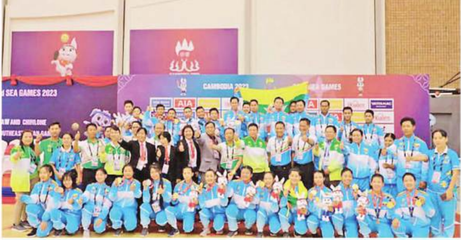
(၃၂)ကြိမ်မြောက် အရှေ့တောင်အာရှအားကစားပြိုင်ပွဲဝင်အားကစားသမားများနှင့် တာဝန်ရှိသူများ စုပေါင်းမှတ်တမ်းတင်ပုံရိပ်စဉ်။

ယနေ့အထိ နိုင်ငံ့ဂုဏ်ဆောင်အားကစား သမားဟောင်းကြီး ၂၃၀ ဦးအား လစဉ် ၁၅၅၀၀၀၀/(ကျပ်တစ်ရာငါးဆယ့်ငါးသိန်း တစ်သောင်းတိတိ)အား ပုံမှန်ထောက်ပံ့ ပေးအပ်လျက်ရှိသည်။ လိုအပ်နေသည့် ကွက်လပ်များကား ရှိနေ ဦးမှာဖြစ်သော်လည်း နိုင်ငံလက်ရွေးစင်