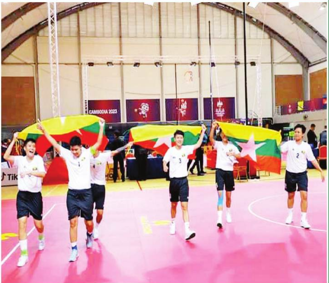
မေ ၁၀ ရက်က ကျင်းပခဲ့သည့် (၃၂)ကြိမ်မြောက် အရှေ့တောင်အာရှအားကစားပြိုင်ပွဲ ပိုက်ကျော်ခြင်းအားကစားနည်း (အမျိုးသမီး) ကွင်းသွင်းခြင်းခတ်ပြိုင်ပွဲတွင် ရွတ်ဆိပ်ဆုရရှိခဲ့သည့် မြန်မာကစားသမားများ အောင်ပွဲခံနေစဉ်။