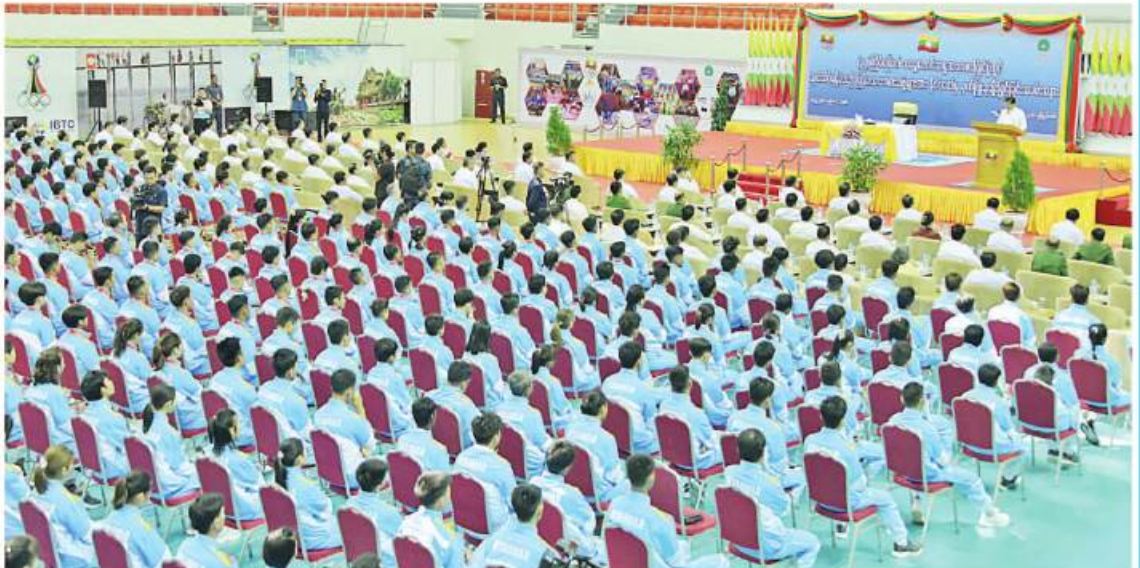
ဇွန် ၁ ရက်က နိုင်ငံတော်စီမံအုပ်ချုပ်ရေးကောင်စီဥက္ကဋ္ဌ နိုင်ငံတော်ဝန်ကြီးချုပ် ဗိုလ်ချုပ်မှူးကြီးမင်းအောင်လှိုင် (၃၂)ကြိမ်မြောက် အရှေ့တောင်အာရှအားကစားပြိုင်ပွဲတွင် ဆုတံဆိပ်ရရှိခဲ့သည့် မြန်မာအားကစားအဖွဲ့များအား နိုင်ငံတော်က ဂုဏ်ပြုဆုများဖြင့် ဝမ်းမြောက်စေခဲ့သည်။

အောင်မြင်မှုဂုဏ်ကို ဆောင်ယူစမြဲဖြစ်သည်။ ပြည်သူတစ်ရပ်လုံး၏သောသောညီအားပေးလက်ခုပ်သံများကိုလည်း မေ့ထား၍မရအဘယ်သို့သော နိုင်ငံအရေးကိစ္စမှန်သမျှ ပြည်သူမပါဘဲ မအောင်မြင်နိုင်ဟူသော အယူအဆသည် ဤဆီးရိမ်းပြိုင်ပွဲကစ၍ ပို၍ထင်ရှားလာသည်ကို သတိပြုမိသည်။