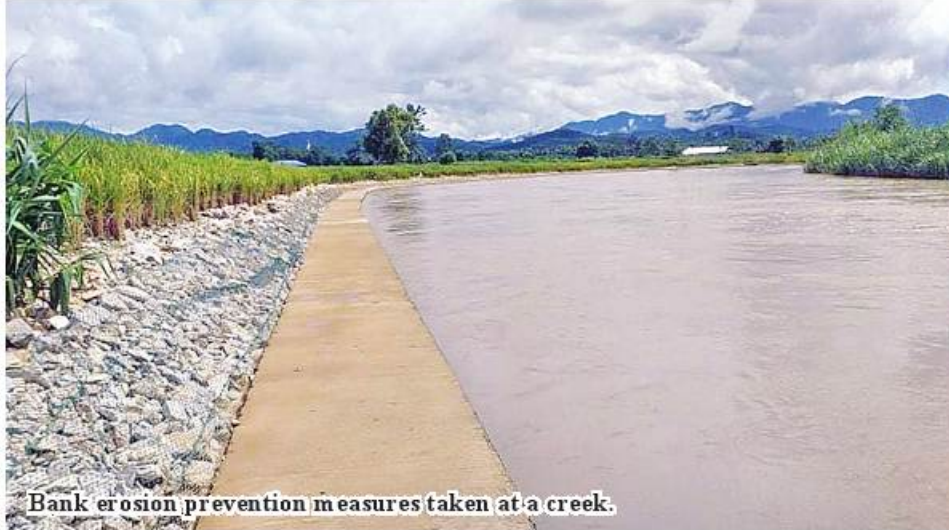
Bank erosion prevention measures taken at a creek.