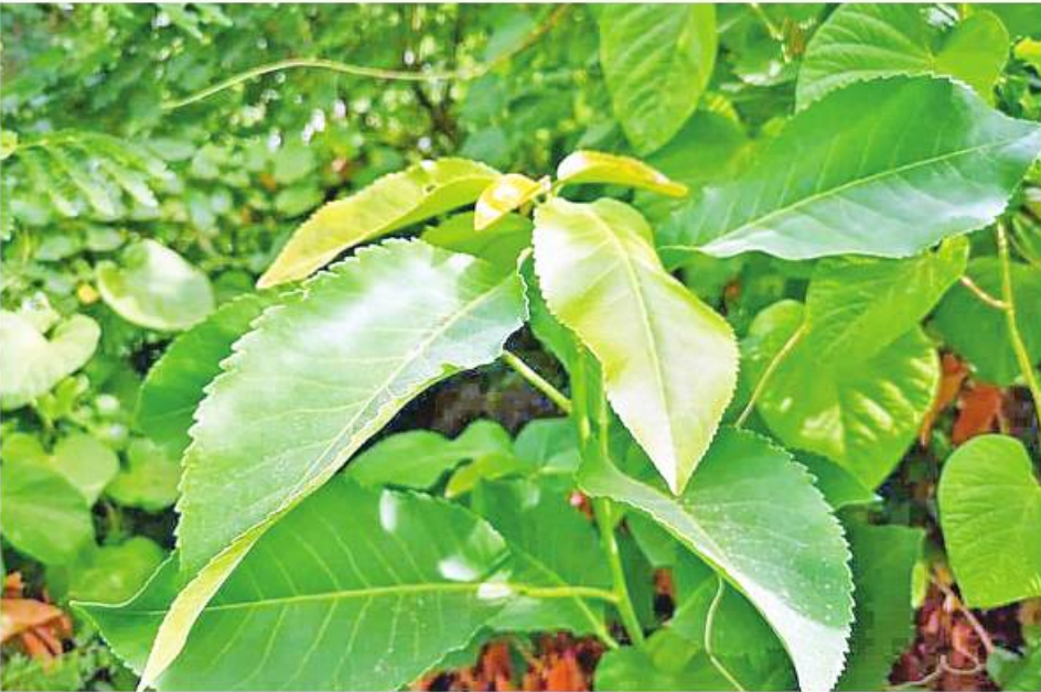
ဆေးဖက်ဝင် သက်ရင်းကြီးပင်ကို တွေ့ရစဉ်။

မေး ။ ။ ဆရာကြီးရှင်ဗျာ ကျွန်တော့်ရဲ့သားလေး အသက် ၁၆ နှစ် ကိုးတန်းကျောင်းသား မှာ အနည်းပြီး မကြာခဏမူးလဲတတ်ပါ