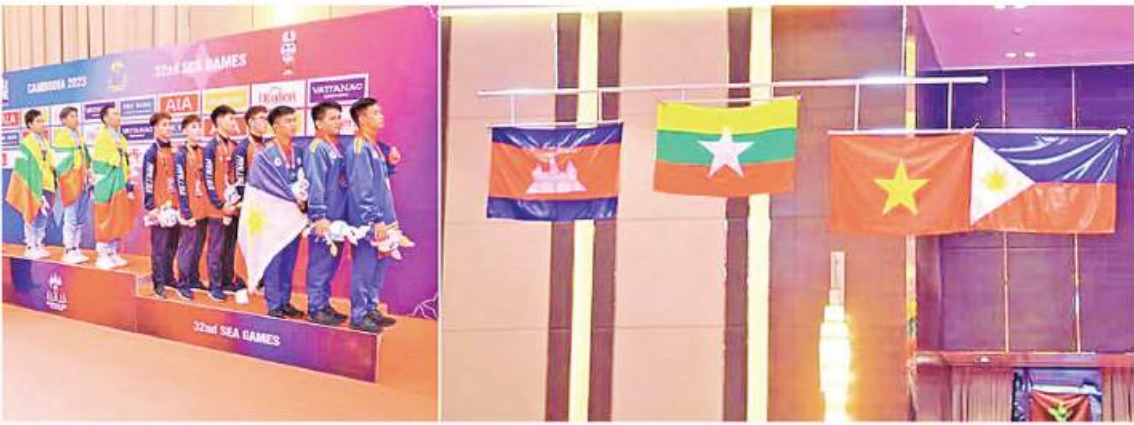
(၃၂)ကြိမ်မြောက် အရှေ့တောင်အာရှအားကစားပြိုင်ပွဲ ဝင်အားကစားသမားများနှင့် တာဝန်ရှိသူများ စုပေါင်းမှတ်တမ်းတင်ပုံရိပ်စဉ်။

သူတို့သည် အမိန့်ခံအတွက် ရေကုန် ရေခဲနံ့ယှဉ်ပြိုင်ခဲ့ကြသူများဖြစ်၍ ထိုက်ထိုက် တန်တန် ချီးမြှင့်ခံထိုက်သူများဖြစ်ကြပါ သည်။ နိုင်ငံ့ဂုဏ်ဆောင် တစ်ဦးချင်း ရွှေတံဆိပ် ဆုရအားကစားသမားတစ်ဦးအတွက် ချီးမြှင့် ငွေမှာ ကျပ်သိန်း ၃၀၀၊ ငွေတံဆိပ် ပိုင်ရှင် တစ်ဦးအတွက် ကျပ်သိန်း ၂၀၀၊ ကြေး တံဆိပ်ပိုင်ရှင်တစ်ဦးအတွက် ကျပ်သိန်း