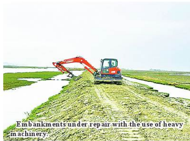
Embankments under repair with the use of heavy machinery.

The soil works will be completed on 3 June. Thanks to repaired embankments, monsoon paddy can be safely cultivated on 14,225 acres of farmlands. It is reported to complete construction of embankments in the first week of June. ASH