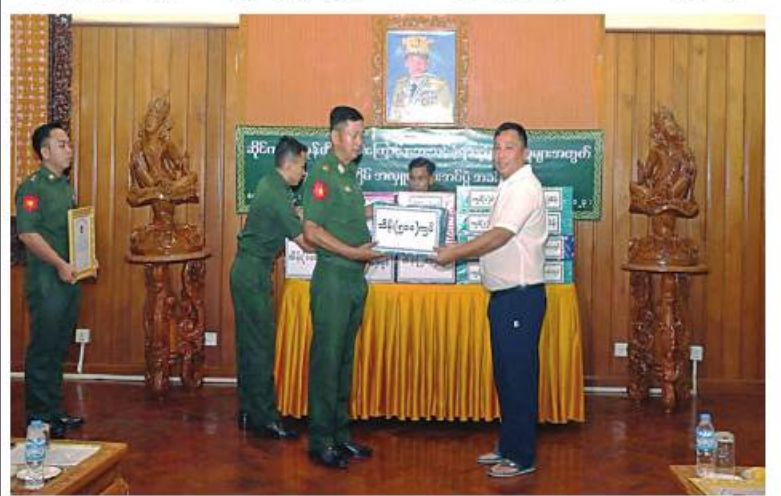
အရှေ့မြောက်တိုင်းစစ်ဌာနချုပ်တိုင်းမှူး ဝိုင်းမျိုးချုပ်စိုးမင်းထံ အလှူရှင်များက မုန်တိုင်းသင့်ဒေသများ၌ ပြန်လည်ထူထောင်ရေးလုပ်ငန်းများတွင် အသုံးပြုနိုင်ရန် အလှူငွေများနှင့် ထောက်ပံ့ပစ္စည်းများ ပေးအပ်လှူဒါန်းစဉ်

နေပြည်တော် ဇွန် ၂ မုန်တိုင်းသင့်ဒေသများတွင် ပြန်လည်ထူထောင်ရေးလုပ်ငန်းများတွင် အသုံးပြုနိုင်ရန်အတွက် အလှူငွေများနှင့် ထောက်ပံ့ပစ္စည်းများ ပေးအပ်လှူဒါန်းပွဲကို ယနေ့မွန်လွှဲပိုင်းတွင် အရှေ့မြောက်တိုင်းစစ်ဌာနချုပ် ရွှေလီဧည့်ခန်းမဆောင်၌ ပြုလုပ်ရာ တိုင်းမှူး ဝိုင်းမျိုးချုပ်စိုးမင်းနှင့် တာဝန်ရှိသူများ၊ သဘာဝဘေးအန္တရာယ်ကြီးကြပ်မှု ကော်မတီအဖွဲ့ဝင်များ၊ ခရိုင်၊ မြို့နယ်စီမံအုပ်ချုပ်ရေးအဖွဲ့ဝင်များ၊ လူမှုရေးအသင်းအဖွဲ့များနှင့် စေတနာရှင်အလှူရှင်များ တက်ရောက်ကြသည်။