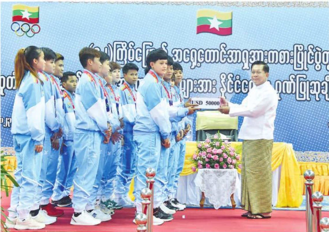
ဇွန် ၁ ရက်က နိုင်ငံတော်စီမံအုပ်ချုပ်ရေးကောင်စီဥက္ကဋ္ဌ နိုင်ငံတော်ဝန်ကြီးချုပ် ဗိုလ်ချုပ်မှူးကြီးမင်းအောင်လှိုင် (၃၂)ကြိမ်မြောက် အရှေ့တောင်အာရှအားကစားပြိုင်ပွဲတွင် ဗိုလ်လုပွဲသို့တက်ရောက်နိုင်ခဲ့သည့် အမျိုးသမီးဘောလုံးအသင်းအား ဂုဏ်ပြုဆုများဖြင့် ဝမ်းမြောက်စေခဲ့သည်။

ကျွန်တော်ထင်ပါသည်။ လက်ရှိ နိုင်ငံတော်အကြီးအကဲသည် အားကစားကဏ္ဍကို အထူးအားပေးပုံရသည်။ နိုင်ငံတော်အကြီးအကဲ၏ နိုင်ငံတစ်ဝန်း ခန့်စစ်များတွင် အားကစားကွင်းများစွာကို သွားရောက်ကွင်းဆင်းကြည့်ရှုစစ်ဆေးပြီး အဆင့်မီပြုပြင်မွမ်းမံရေး လမ်းညွှန်မှာကြားခြင်းနှင့် အားကစားအထောက်အကူပြုပစ္စည်းများစွာဖြည့်ဆည်းပံ့ပိုးပေးခြင်းတို့ ဆောင်ရွက်သည်ကို သတင်းများတွင် တွေ့မြင်ရသည်။ ထိုလမ်းညွှန်ချက်နှင့်အညီ သုဝဏ္ဏအားကစားရုံကြီးမှာလည်း မြန်မြန်ဆန်ဆန် ပြန်လည်အဆင့်မြင့်မားလာခဲ့သည်။ တစ်နိုင်ငံလုံးက ဘောလုံးကွင်းများအပါအဝင် အားကစားကွင်းများ ပြန်လည်တိုးတက်လာခဲ့သည်။ အားကစားပြိုင်ပွဲများ၊ လှုပ်ရှားမှုများ ပြန်လည်အသက်ဝင်လာခဲ့သည်။ နိုင်ငံတော်နေ့ကြီးနေ့ထူးများတွင် ကျောင်း