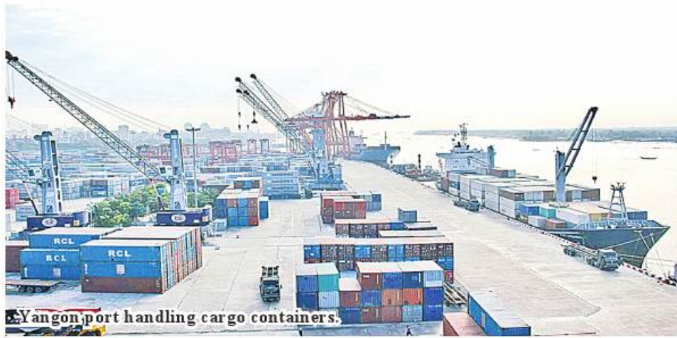
Yangon port handling cargo containers.

Nay Pyi Taw June 2 Myanmar has conducted trade with 167 trading partner countries in 2022-2023 FY, with the largest amount of trade from China, Thai-