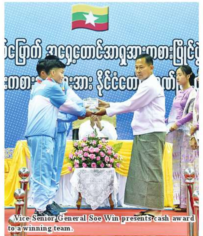
Vice-Senior General Soe Win presents cash award to a winning team.

tional Boat Race and weightlifting events among 19 competing events in the 32nd SEA Games held in Cambodia. Except volleyball and tennis events among 11 sports events, Myanmar athletes secured 25 silvers and 68 bronze medals. Silver medallists could reach the final matches with their brilliant efforts despite winning the gold medals. Myanmar women's football team could sail to the final match whereas Myanmar men's team could advance to the semifinal match. As the government recognized their efforts, officials often encouraged them. Now, deserved cash awards were presented to them. In this regard, the government pre-