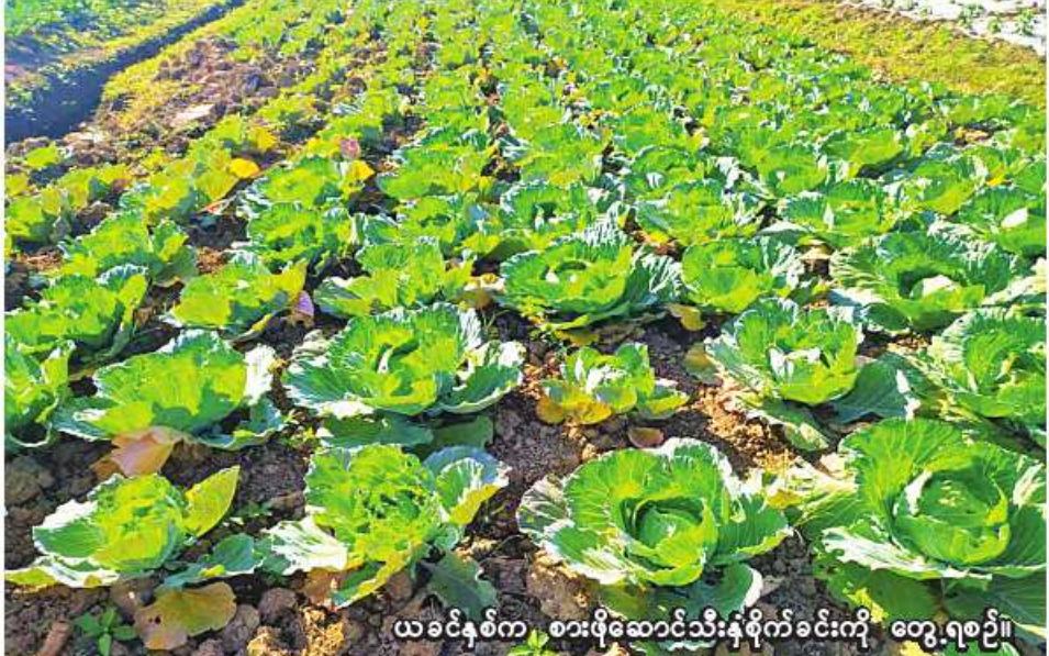
ယခုနှစ်က စားဖိုဆောင်သီးနှံစိုက်ခင်းကို တွေ့ရစဉ်။