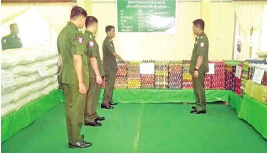
အနောက်တောင်တိုင်းစစ်ဌာနချုပ်တိုင်းမှူး ဝိုင်းဖျားချုပ်ကြံညီခိုင် ရခိုင်ပြည်နယ်အတွင်းရှိ မုန်တိုင်းဒဏ်သင့်ပြည်သူများကို ဆန်၊ ဆီနှင့် စားသောက်ကုန်ပစ္စည်းများ လှူဒါန်းရန် ဖွဲ့စည်းပေးထားသည့် အဖွဲ့ဝင်များနှင့်အတူ ဖြစ်ပေါ်ခဲ့သည့် ရခိုင်ပြည်နယ်အတွင်းရှိ မုန်တိုင်းဒဏ်သင့်ပြည်သူများကို အနောက်တောင်တိုင်းစစ်ဌာနချုပ်နှင့် ကွပ်ကဲမှုအောက် တပ်ရင်း၊တပ်ဖွဲ့များက ဆန်၊ဆီနှင့် စားသောက်ကုန်ပစ္စည်းများ လှူဒါန်းရန် အတွက် တိုင်းစစ်ဌာနချုပ် ဧရာဝတီခန်းမ၌ စုဖွဲ့ပြင်ဆင်ထားရှိမှု အခြေအနေများကို ယနေ့နံနက်ပိုင်းတွင် တိုင်းမှူး ဝိုင်းဖျားချုပ်ကြံညီခိုင်နှင့် တာဝန်ရှိသူများက သွားရောက်ကြည့်ရှုသည်။ အဆိုပါ လှူဒါန်းပစ္စည်းများကို တိုင်းစစ်ဌာနချုပ်မှ

မော်တော်ယာဉ်များဖြင့် သယ်ဆောင်၍ ပုသိမ်မြို့မှ ရန်ကုန်မြို့ရှိ မင်္ဂလာဒုံလေဆိပ်သို့ပို့ဆောင်ပြီး ၎င်းမှတစ်ဆင့် ရခိုင်ပြည်နယ်အတွင်းရှိ မုန်တိုင်းဒဏ်သင့်ပြည်သူများကို ဆက်လက်ပေးပို့လှူဒါန်းမည်ဖြစ်ကြောင်းနှင့် ဧရာဝတီတိုင်းဒေသကြီး အစိုးရအဖွဲ့၊ တိုင်းစစ်ဌာနချုပ်နှင့် ကွပ်ကဲမှုအောက် တပ်ရင်း၊ တပ်ဖွဲ့များက လှူဒါန်းသည့် အပင်မျိုးစုံ ၄၉၁၇၆ ပင်နှင့် ဆောက်လုပ်ရေးပစ္စည်းများကို ဟိုင်းကြီးကျွန်းမြို့ ကမ်းထိုးရပ်မှ စစ်ရေယာဉ်ဖြင့် သယ်ဆောင်ပြီး ရခိုင်ပြည်နယ်အတွင်းရှိ လေဘေးသင့်ဒေသများကို ပေးပို့လှူဒါန်းသွားမည်ဖြစ်ကြောင်း သတင်းရရှိသည်။