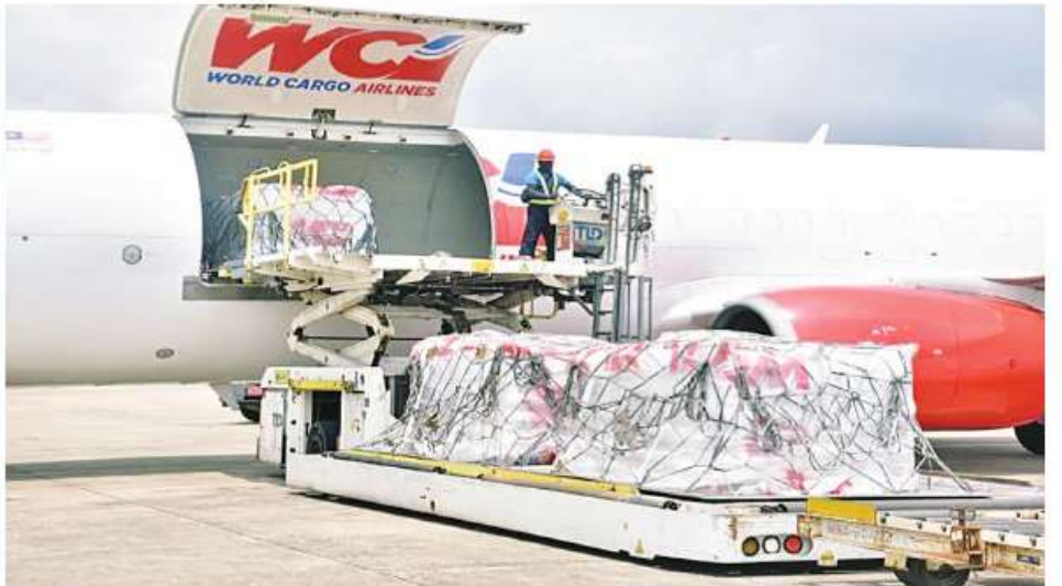
မြန်မာနိုင်ငံရှိ မိုခါမုန်တိုင်းဒဏ်သင့် ပြည်သူများထံသို့ အာဆီယံနိုင်ငံများမှ ပေးပို့သည့် အကူအညီပစ္စည်းများ စတုတ္ထအသုတ်အဖြစ် ရန်ကုန်အပြည်ပြည်ဆိုင်ရာလေဆိပ်သို့ ရောက်ရှိစဉ်။

သဘာဝဘေးအန္တရာယ်ဆိုင်ရာ စီမံခန့်ခွဲမှု ဘဏ္ဍာရေးဌာန၏ ကြီးကြပ်မှုနှင့် တိုင်းဒေသကြီးနှင့် ပြည်နယ်အစိုးရများ၊ ဝန်ကြီးဌာနအသီးသီးနှင့် အချိန်နှင့်တစ်ပြေးညီ ပူးပေါင်း ဆောင်ရွက်လက်ရှိပြီး AHA Centre သက်ဆိုင်ရာ နိုင်ငံတကာအဖွဲ့အစည်းများနှင့်လည်း အပြည်အဝှမ်းပူးပေါင်းဆောင်ရွက်လျက်ရှိကြောင်း သတင်းရရှိသည်။