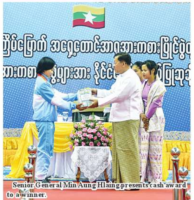
Senior General Min Aung Hlaing presents cash award to a winner.