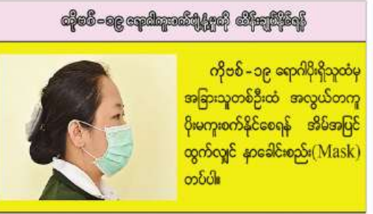
ကိုဗစ်-၁၉ ရောဂါကူးစက်မှုကို ထိန်းချုပ်နိုင်ရန်