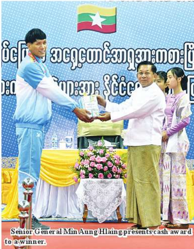
Senior General Min Aung Hlaing presents cash award to a winner.