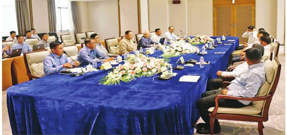
အမျိုးသားစည်းလုံးညီညွတ်ရေးနှင့် ငြိမ်းချမ်းရေးဖော်ဆောင်မှုညှိနှိုင်းရေးကော်မတီနှင့် MNDA၊ TNLA၊ AA ကိုယ်စားလှယ်အဖွဲ့တို့ တွေ့ဆုံဆွေးနွေးပွဲ ထောက်ထားမှုဆိုင်ရာ အကူအညီများ အမြန်ဆုံး အဆင်ပြေချောမွေ့စွာရောက်ရှိ နိုင်ရေးကိစ္စများကိုလည်း နှစ်ဖက်ရင်းနှီး ပွင့်လင်းစွာအပြန်အလှန် ဆွေးနွေးညှိနှိုင်း ထောက်ထားမှုဆိုင်ရာ အကူအညီများ ခဲ့ကြပြီး ဆွေးနွေးပွဲပထမနေ့ကို ရပ်နားခဲ့ ကြသည်။ အမျိုးသား စည်းလုံးညီညွတ်ရေးနှင့် ငြိမ်းချမ်းရေးဖော်ဆောင်မှု ညှိနှိုင်းရေး ကော်မတီအနေဖြင့် တိုင်းရင်းသားလက်နက် ကိုင်အဖွဲ့များနှင့်၎င်း ၂ ရက်တွင်ဆက်လက် တွေ့ဆုံ ဆွေးနွေးသွားမည်ဖြစ်ကြောင်း သတင်းရရှိသည်။

ပါတီ(MNTJP/MNDA)၊ ပလောင်ပြည်နယ်လွတ်မြောက်ရေးတပ်ဦး(PSLF/TNLA)နှင့် ရက္ခိုင့်အမျိုးသားအဖွဲ့ချုပ်(ULA/AA)တို့မှ ကိုယ်စားလှယ်များ တက်ရောက်ကြသည်။ ဆွေးနွေးပွဲ၌ ပြည်ထောင်စုသမ္မတမြန်မာနိုင်ငံတော်တွင် ပါတီစုံဒီမိုကရေစီ နိုင်ငံရေးစနစ် ခိုင်မာစေရေးကိစ္စတိုင်းရင်းသားပြည်သူတစ်ရပ်လုံး၏လိုလားချက်ပန်းတိုင်ဖြစ်သည့် ဒီမိုကရေစီနှင့် ဖက်ဒရယ်စနစ်တို့ကို အခြေခံသော ပြည်ထောင်စုတည်ဆောက်ရေး ကိစ္စ၊ ပြည်ထောင်စုငြိမ်းချမ်းရေးနှင့်ဖွံ့ဖြိုးတိုးတက်ရေးအတွက် လက်တွဲပူးပေါင်းအကောင်အထည်ဖော်နိုင်ရေးကိစ္စနှင့် တိုင်းရင်းသားလက်နက်ကိုင်အဖွဲ့များနှင့် ယုံကြည်မှု တည်ဆောက်ရေးဆိုင်ရာကိစ္စများကိုရှင်းလင်း ဆွေးနွေးပြီး ဖမ်းဆီးထားသူများ ပြန်လည်လွတ်မြောက်ရေးကိစ္စ၊ မတရားအသင်းမှ ပယ်ဖျက်ရေးကိစ္စနှင့် မိုခါမုန်တိုင်းဒဏ်သင့် ပြည်သူများထံသို့ လူသားချင်းစာနာ