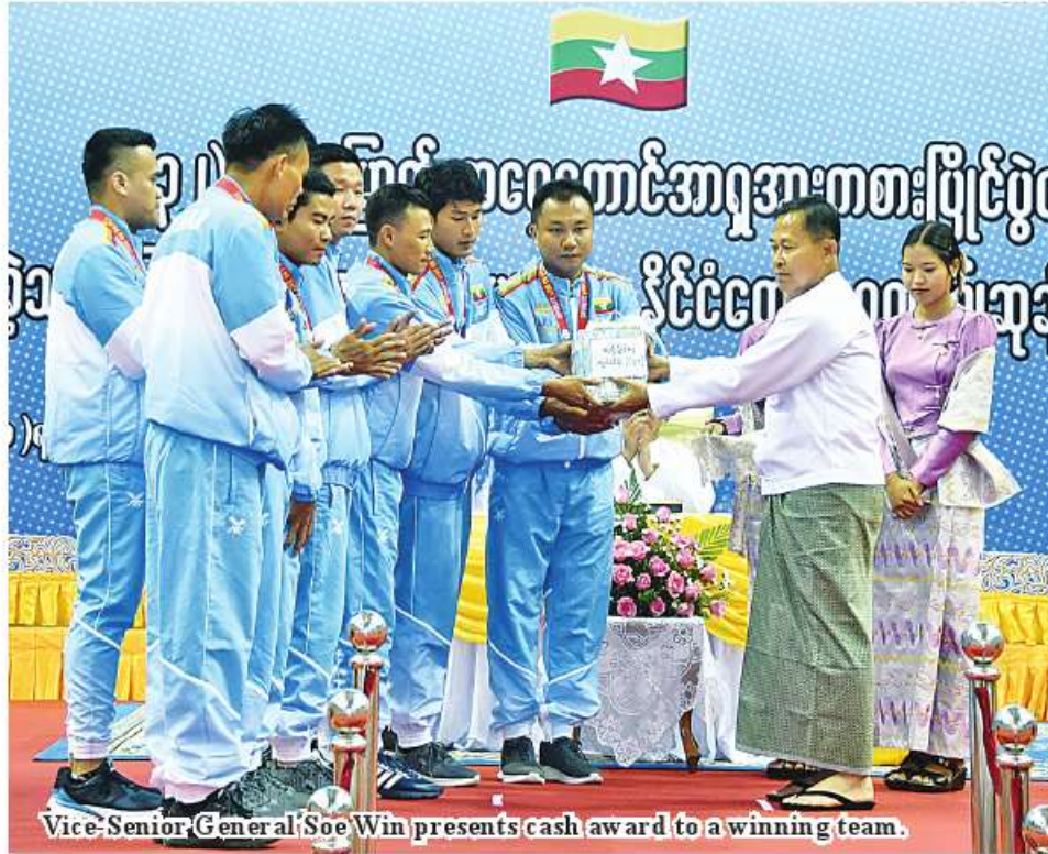
Vice-Senior General Soe Win presents cash award to a winning team.