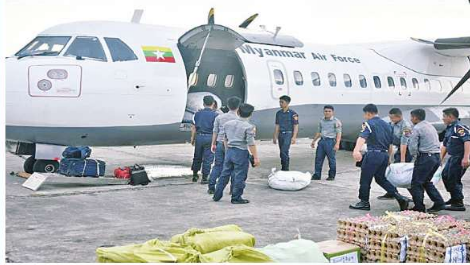
ရခိုင်ပြည်နယ်အတွင်းရှိ သဘာဝဘေးဒဏ်သင့် ပြည်သူများအတွက် ထောက်ပံ့ရေးပစ္စည်းများကို တပ်မတော်(လေ)မှ လေယာဉ်များဖြင့် ဆက်လက်ပို့ဆောင်ပေးစဉ်။

(ကြည်း၊ရေ၊လေ)မိသားစုများ၊ စေတနာရှင်အလှူရှင်များက လှူဒါန်းသည့် စားသောက်ဖွယ်ရာများ၊ ကူညီထောက်ပံ့ရေးပစ္စည်းများ၊ အမျိုးသားသဘာဝဘေးအန္တရာယ်ဆိုင်ရာ စီမံခန့်ခွဲမှုကော်မတီက ထောက်ပံ့ပေးအပ်သည့် ပစ္စည်းများကိုလည်း တပ်မတော်(လေ)မှ လေယာဉ်များဖြင့် ကူညီပို့ဆောင် ပေးလျက်ရှိသည်။ ထိုသို့ ပို့ဆောင်ပေးလျက်ရှိရာ ယနေ့တွင် သဘာဝဘေးဒဏ်သင့်ဒေသများတွင် ကူညီကယ်ဆယ်ရေးလုပ်ငန်းများ ဆောင်ရွက်ပေးနိုင်ရေးအတွက် ပြန်လည်ထူထောင်ရေးလုပ်ငန်းများတွင် ကူညီဆောင်ရွက်ပေးကြမည့် တပ်မတော်သားများနှင့် ဌာနဆိုင်ရာဝန်ထမ်းများလိုက်ပါပြီး