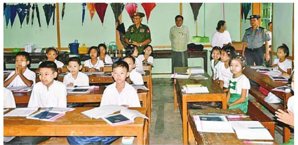
ကာကွယ်ရေးဦးစီးချုပ်ရုံး(ကြည်း)မှ ဒုတိယဗိုလ်ချုပ်ကြီးလူအေး ကျောင်းသား၊ ကျောင်းသူများ ပညာသင်ကြားနေမှုကို ကြည့်ရှုအားပေးစဉ်။

နေပြည်တော် ဇွန် ၁ နိုင်ငံတော် စီမံအုပ်ချုပ်ရေးကောင်စီ အနေဖြင့် ဆိုင်ကလုန်းမုန်တိုင်း(မိုခါ) တိုက်ခတ်မှုကြောင့် ထိခိုက်ပျက်စီးခဲ့သည့် ဒေသများကို သဘာဝဘေးအန္တရာယ် ဆိုင်ရာ စီမံခန့်ခွဲမှုပဒေပုဒ်မ ၁၁ အရ သဘာဝဘေးအန္တရာယ် ကျရောက်သော ဒေသများအဖြစ် ကြေညာချက်များ ထုတ်ပြန်၍ ယင်းကြေညာချက်များပါ ဒေသများတွင် ပြန်လည်ထူထောင်ရေးလုပ်ငန်းများဆောင်ရွက်နိုင်ရန် ဒေသအလိုက် တပ်မတော်အရာရှိကြီးများကို ခန့်အပ်တာဝန်ပေးထားပြီးဖြစ်သည်။ ထိုသို့ ပြန်လည်ထူထောင်ရေးလုပ်ငန်းများ ဆောင်ရွက်ရန်အတွက် ခန့်အပ်တာဝန်ပေးအပ်ထားရှိရာ ယနေ့တွင် ကျောက်ဖြူမြို့သို့ ရောက်ရှိနေသည့် ကာကွယ်ရေးဦးစီးချုပ်ရုံး(ကြည်း)မှ ဒုတိယဗိုလ်ချုပ်ကြီးလူအေးသည် တာဝန်ရှိသူများနှင့်အတူ ကျောက်ဖြူမြို့ရှိ အခြေခံပညာကျောင်းများနှင့် ကောလိပ်ကျောင်းများ၌ ကျောင်းများ စတင်ဖွင့်လှစ်သင်ကြားနေမှု