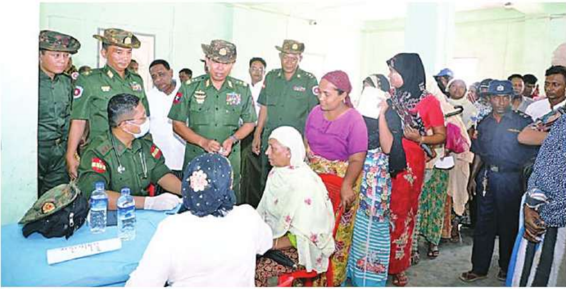
ကာကွယ်ရေးဦးစီးချုပ်ရုံး(ကြည်း)မှ ဒုတိယဗိုလ်ချုပ်ကြီးဖုန်းမြတ် ဒေသခံပြည်သူများအား ကျန်းမာရေးစောင့်ရှောက်မှုလုပ်ငန်း ဆောင်ရွက်ပေးနေမှုကို ကြည့်ရှုအားပေးစဉ်။

နေပြည်တော် ဇွန် ၁ နံနက်ပိုင်းတွင် ရခိုင်ပြည်နယ် စစ်တွေမြို့ရှိ ကာကွယ်ရေးဦးစီးချုပ်ရုံး (ကြည်း)မှ ဒုတိယဗိုလ်ချုပ်ကြီးဖုန်းမြတ်၊ အနောက်ပိုင်းတိုင်းစစ်ဌာနချုပ် တိုင်းမှူး ဗိုလ်ချုပ်ထင်လတ်ဦးနှင့် အဖွဲ့ဝင်များသည် ယနေ့