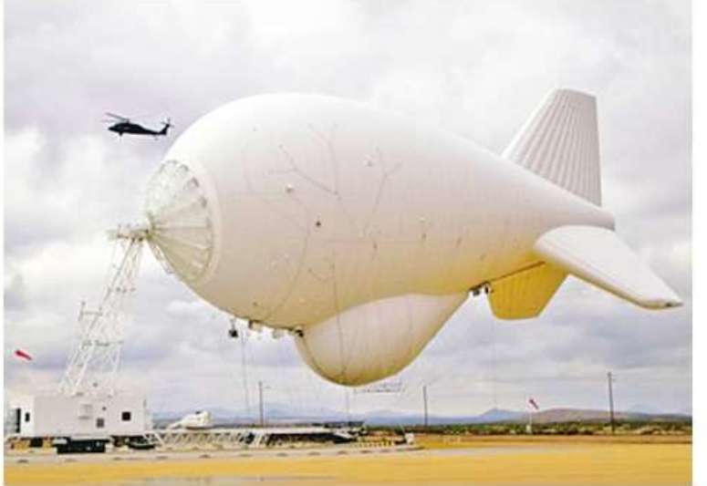
အကောင်းဆုံး လုပ်ဆောင်နိုင်သည်။ Aerostat-Based Surveillance Poland Looking Into US System ကို ဘာသာပြန်ဆိုထားပါသည်။

ခရုဒုံးကျည်ကဲ့သို့သော အနိမ့်ပျံပစ်မှတ်များကို ခြေရာခံနိုင်စွမ်းရှိသည်။ ရုရှားဘက်မှ ဖြတ်ကျော်ကျရောက်လာသော ဒုံးကျည်အပိုင်းအစများကို ဧပြီလက ပိုလန်နိုင်ငံ တောအုပ်ထဲတွင် တွေ့ရှိခဲ့ကြောင်း ပိုလန်နိုင်ငံ ကာကွယ်ရေးဌာနမှ ပြောကြားခဲ့သည်။ အဆိုပါ လေဘောလုံးထောက်လှမ်းရေးစနစ်သည် အခြားတင်းထောက်နှင့် စောင့်ကြည့်ရေးစနစ်များထက် လေထဲတွင် ကြာကြာနေနိုင်သည်။ TARS လေဘောလုံးလွတ်တင်၍ စောင့်ကြည့်ထောက်လှမ်းရေးစနစ်များသည် ထောက်လှမ်းနိုင်မှု အတွာအဝေးပိုင် ၂၀၀ (၃၂၂ ကီလိုမီတာ)ရှိပြီး အနိမ့်အနွေး ပျံသန်းသောလေယာဉ် ရေကြောင်းနှင့်မြေပြင်ပစ်မှတ်များကို ထောက်လှမ်းရန်