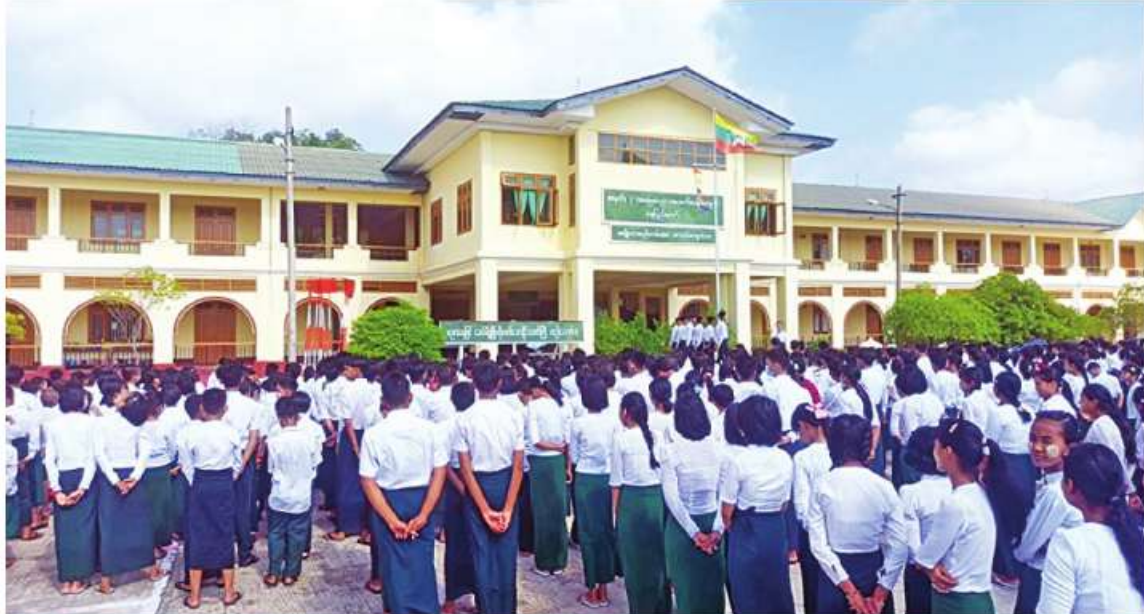
နေပြည်တော်ကောင်စီနယ်မြေ ပုဗ္ဗသီရိမြို့နယ် အမှတ်(၃) အခြေခံပညာအထက်တန်းကျောင်းစတင်ဖွင့်လှစ်နေမှုကို တွေ့ရစဉ်။