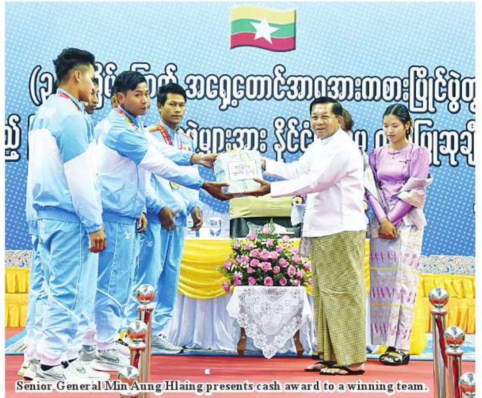
Senior General Min Aung Hlaing presents cash award to a winning team.