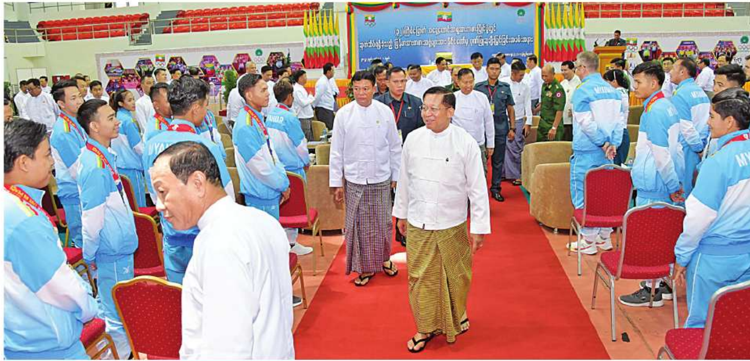
နိုင်ငံတော်စီမံအုပ်ချုပ်ရေးကောင်စီဥက္ကဋ္ဌ နိုင်ငံတော်ဝန်ကြီးချုပ် ဗိုလ်ချုပ်မှူးကြီးမင်းအောင်လှိုင် နိုင်ငံ့ဂုဏ်ဆောင်အားကစားသမားများနှင့် နည်းပြများကို ရင်းရင်းနှီးနှီး နှုတ်ဆက်စဉ်။

စာမျက်နှာ ၁၇ မှအဆက် မြန်မာနိုင်ငံသားအားလုံးကလိုလားတောင့်တနေသည့် ဘောလုံးပြိုင်ပွဲ ရွှေတံဆိပ်ဆုရရှိရေးကိုလည်း အမျိုးသားရေးအဖြစ် ဦးတည်ကြိုးပမ်းကြရန် တိုက်တွန်းလိုပါကြောင်း၊ အလားတူ အချိန်အခါကြီးခဲ့သော အစဉ်အလာရှိခဲ့သည့် ဘော်လီဘော၊ ပြေးခုန်ပစ်၊ အလေးမနှင့် လက်ဝှေ့ပြိုင်ပွဲများတွင်လည်း ရွှေတံဆိပ်များလွှမ်းမိုးနိုင်အောင် ကြိုးပမ်းကြရန် အားကစားသမားများနှင့် အဖွဲ့ချုပ်များကို တိုက်တွန်းလိုပါကြောင်း။