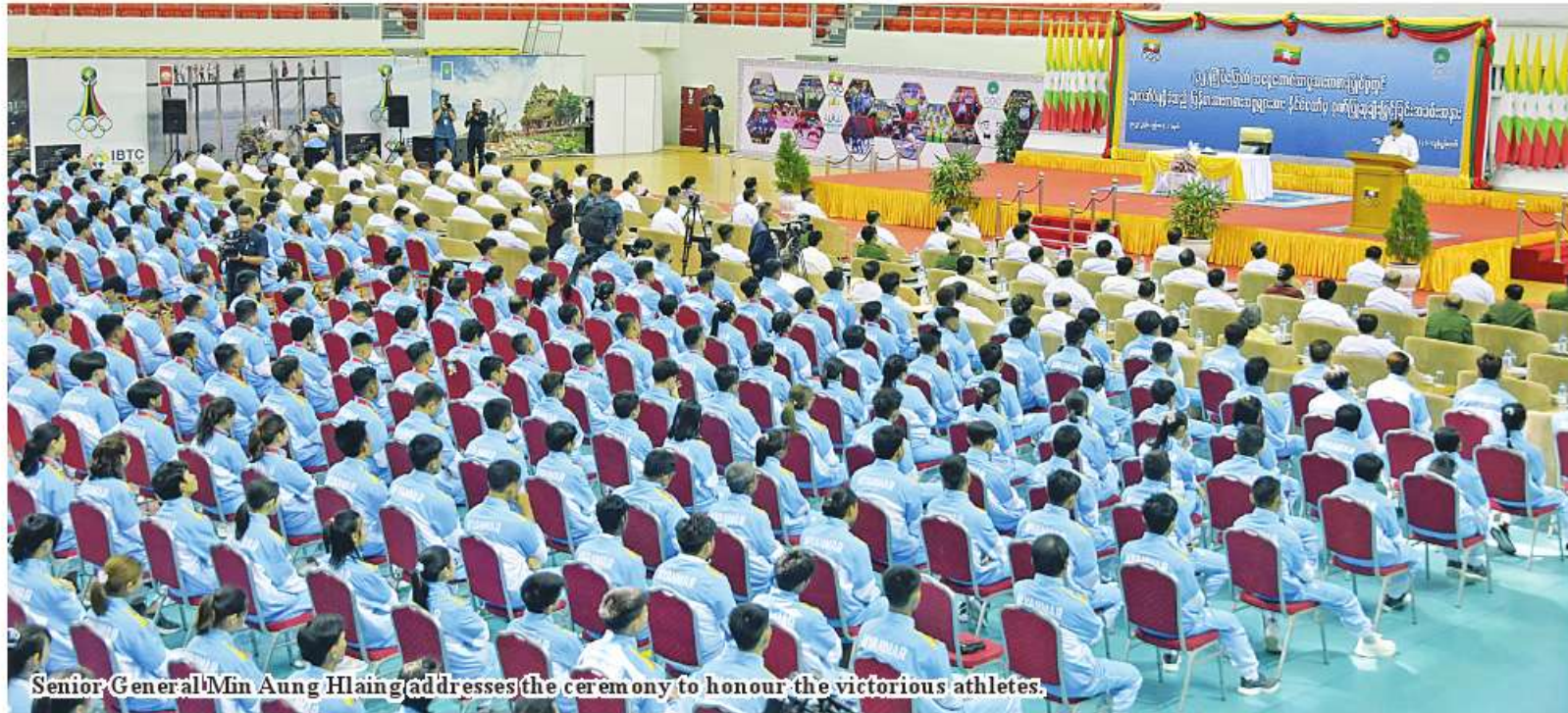
Senior General Min Aung Hlaing addresses the ceremony to honour the victorious athletes.

and Air) General Maung Maung Aye, senior military officers from Office of Commander-in-Chief, the Nay Pyi Taw Command commander, deputy ministers, members of Myanmar Olympic Council, chairs and vice chairs of Myanmar sports federations, honoured guests, athletes who bring honour to the nation, managers and coaches and officials.