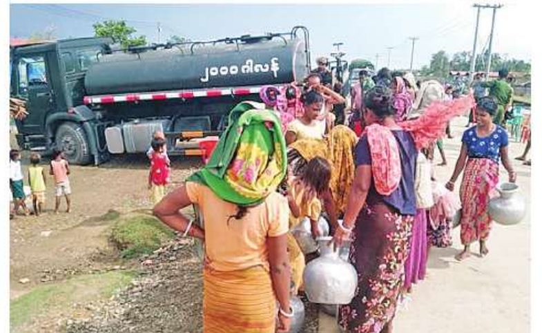
တပ်မတော်မှ ကူညီကယ်ဆယ်ရေးအဖွဲ့က ဒေသခံပြည်သူများကို သောက်သုံးရေ ဖြန့်ဝေပေးစဉ်။

နေသော သစ်ပင်သစ်ကိုင်းများ ခုတ်ထွင် ရှင်းလင်းခြင်းနှင့် ဒြပ်ချောင်းကျေးရွာ အုပ်စု၌ ဒေသခံပြည်သူများကို ကျန်းမာရေး စောင့်ရှောက်မှုလုပ်ငန်းများ ဆောင်ရွက် ပေးလျက်ရှိသည်။ ထို့အတူ ရသေ့တောင်မြို့သို့ရောက်ရှိ နေသည့် ကူညီကယ်ဆယ်ရေးအဖွဲ့များ သည် တောင်ရင်းတန်းရပ်ကွက်နှင့် အရှေ့တောင်ရပ်ကွက်တို့ရှိ ဒေသခံပြည်သူ များကို ဆန်နှင့် စားသောက်ဖွယ်ရာများကို ထောက်ပံ့ပေးအပ်လျက်ရှိသည်။ အလားတူ မြောက်ဦးမြို့သို့ရောက်ရှိ နေသည့် ကူညီကယ်ဆယ်ရေးအဖွဲ့များ သည် ရွှေတောင်ဘုန်းတော်ကြီးကျောင်းရှိ ကျောင်းထိုင်ဆရာတော်အား လှူဖွယ် ပစ္စည်းများ ဆက်ကပ်လှူဒါန်းပြီး လဲကျနေ သော သစ်ပင်သစ်ကိုင်းများ ခုတ်ထွင်ရှင်း လင်းခြင်းနှင့် နဒင်ကျေးရွာရှိ ဒေသခံ ပြည်သူများကို ကျန်းမာရေးစောင့်ရှောက်မှု လုပ်ငန်းများ ဆောင်ရွက်ပေးလျက် ရှိသည်။ ထို့အတူ စစ်တွေမြို့သို့ရောက်ရှိနေ သည့် ကူညီကယ်ဆယ်ရေးအဖွဲ့များသည် ရွှေတောင်ဘုန်းတော်ကြီးကျောင်းရှိ ရွာသစ်