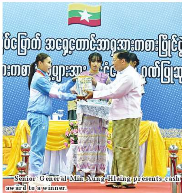
Senior General Min Aung Hlaing presents cash award to a winner.