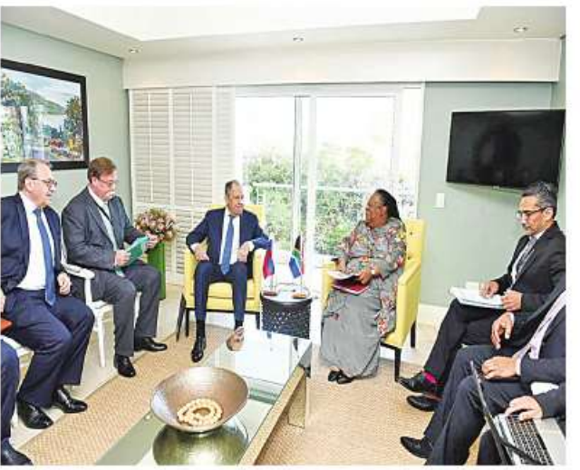
ဘရစ်အုပ်စုကို တရုတ်၊ ရုရှား၊ နိုင်ငံတို့ဖြင့် ဖွဲ့စည်းထားကြောင်း အိန္ဒိယ၊ တောင်အာဖရိက၊ ဘရာဇီး သိရသည်။ KKO

ဂျီဟန်နက်ဇာတ် နှစ် ၁ ရေးဝန်ကြီးများအစည်းအဝေးသည် စီးပွားရေး အင်အားကြီးနိုင်ငံ လာမည်ပြုလုပ်လွှတ်လွှတ် ဂျီဟန်နက်ဇာတ်တို့ဖြင့်ကျင်းပမည့် ဘရစ်အုပ်စု ဘီအာရ်အိုဝ်စီအက်စ် ထိပ်သီးညီလာခံ၏ အကြိုဆွေးနွေးပွဲ ဖြစ်သည်။ ယနေ့ဆွေးနွေးပွဲတွင် ဘရစ်အုပ်စု နိုင်ငံခြားရေးဝန်ကြီးများသည် ဘရစ်အဖွဲ့ အင်အားတိုးချဲ့ရေးကိုဆွေးနွေးမည်ဖြစ်သည်။ ဘရစ်အဖွဲ့၌ပါဝင်ရန် ဗင်နီဇွဲလား၊ အာဂျင်တီးနား၊ အီရန်၊ အယ်လ်ဂျီးရီးယား၊ ဆော်ဒီအာရေဗျနှင့် အာရပ်စော်ဘွားများပြည်ထောင်စု (ယူအေအီး) တို့က စိတ်ဝင်စားလျက် ယနေ့ ဘရစ်အုပ်စုနိုင်ငံခြား