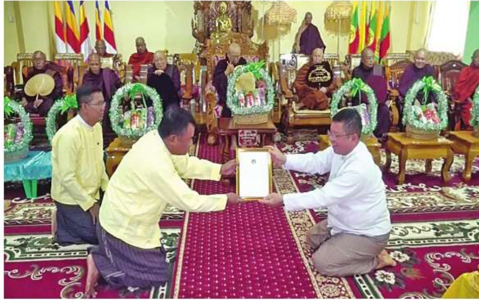
မွန်ပြည်နယ် ဝန်ကြီးချုပ် ဦးအောင်ကြည်သိန်း ထံ မွန်ပြည်နယ် ဗုဒ္ဓဘာသာ ကလျာဏယုဝအသင်း (YMBA)မှ တာဝန်ရှိသူ တစ်ဦးက အလှူငွေနှင့် ထောက်ပံ့ပစ္စည်းများ လှူဒါန်းရာ ဂုဏ်ပြု မှတ်တမ်းလွှာ ပြန်လည်ပေးအပ်စဉ်။

နေပြည်တော် ဇွန် ၁ - အသင်း(YMBA)က ပြုလုပ်သော မိုးခါ ရေပစ္စည်းများ လွှဲပြောင်းပေးအပ် မွန်ပြည်နယ် ဗုဒ္ဓဘာသာကလျာဏယုဝ မုန်တိုင်းဒဏ်သင့်ပြည်သူများအားထောက်ပံ့ လှူဒါန်းခြင်းကို ယနေ့နံနက်ပိုင်းတွင်