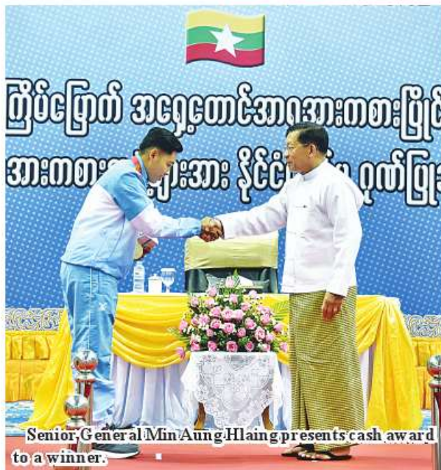
Senior General Min Aung Hlaing presents cash award to a winner.