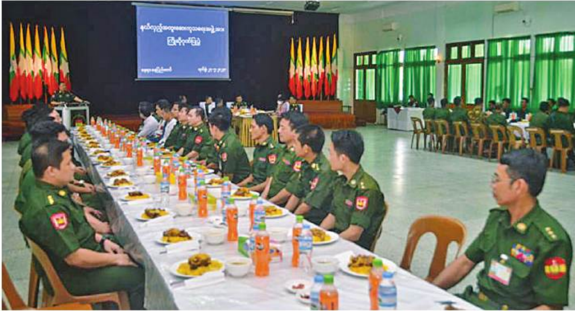
စစ်ကိုင်းတိုင်းဒေသကြီးအတွင်းရှိ ရွှေဘိုမြို့ပေါ်နှင့် ကျေးလက်နေ ဒေသခံပြည်သူများကို ကျန်းမာရေးစောင့်ရှောက်မှုလုပ်ငန်းများ ဆောင်ရွက်ပေးခဲ့သည့် တပ်မတော်နှင့် ကျန်းမာရေးဝန်ကြီးဌာနတို့မှ နယ်လှည့်အထူးဆေးကုသရေးအဖွဲ့ကို နေ့လယ်စာဖြင့် တည်ခင်းစဉ်ခံစားခဲ့ခြင်း

စစ်ကိုင်းတိုင်းဒေသကြီး ရွှေဘိုမြို့ပေါ်နှင့် ကျေးလက်နေဒေသခံပြည်သူများကို ကျန်းမာရေးစောင့်ရှောက်မှုလုပ်ငန်းများဆောင်ရွက်ပေးရန် သွားရောက်ခဲ့သည့် ပါရဂူများ၊ ဆေးမှူးများနှင့် သူနာပြုများ ပါဝင်သော တပ်မတော်နှင့် ကျန်းမာရေးဝန်ကြီးဌာနမှ အထူးဆေးကုသရေးအဖွဲ့သည် ယနေ့နံနက်ပိုင်းတွင် နေပြည်တော်သို့ ပြန်လည်ရောက်ရှိကြရာ ကာကွယ်ရေးဦးစီးချုပ်ရုံး(ကြည်း)မှ တွဲဖက်စစ်ရေးချုပ် ဝိုင်းချုပ်ထိန်လင်း၊ ဆေးဝန်ထမ်းညွှန်ကြားရေးမှူးရုံး ညွှန်ကြားရေးမှူးနှင့်ကျန်းမာရေးဝန်ကြီးဌာနမှ တာဝန်ရှိသူများ၊ တပ်မတော်အရာရှိကြီးများက လေ့လာသိရှိ မြို့နယ်ရှိ တပ်မတော်ဆေးရုံ(ခုတ်-၁၀၀၀) ၌ ကြိုဆိုနှုတ်ဆက်ကြသည်။