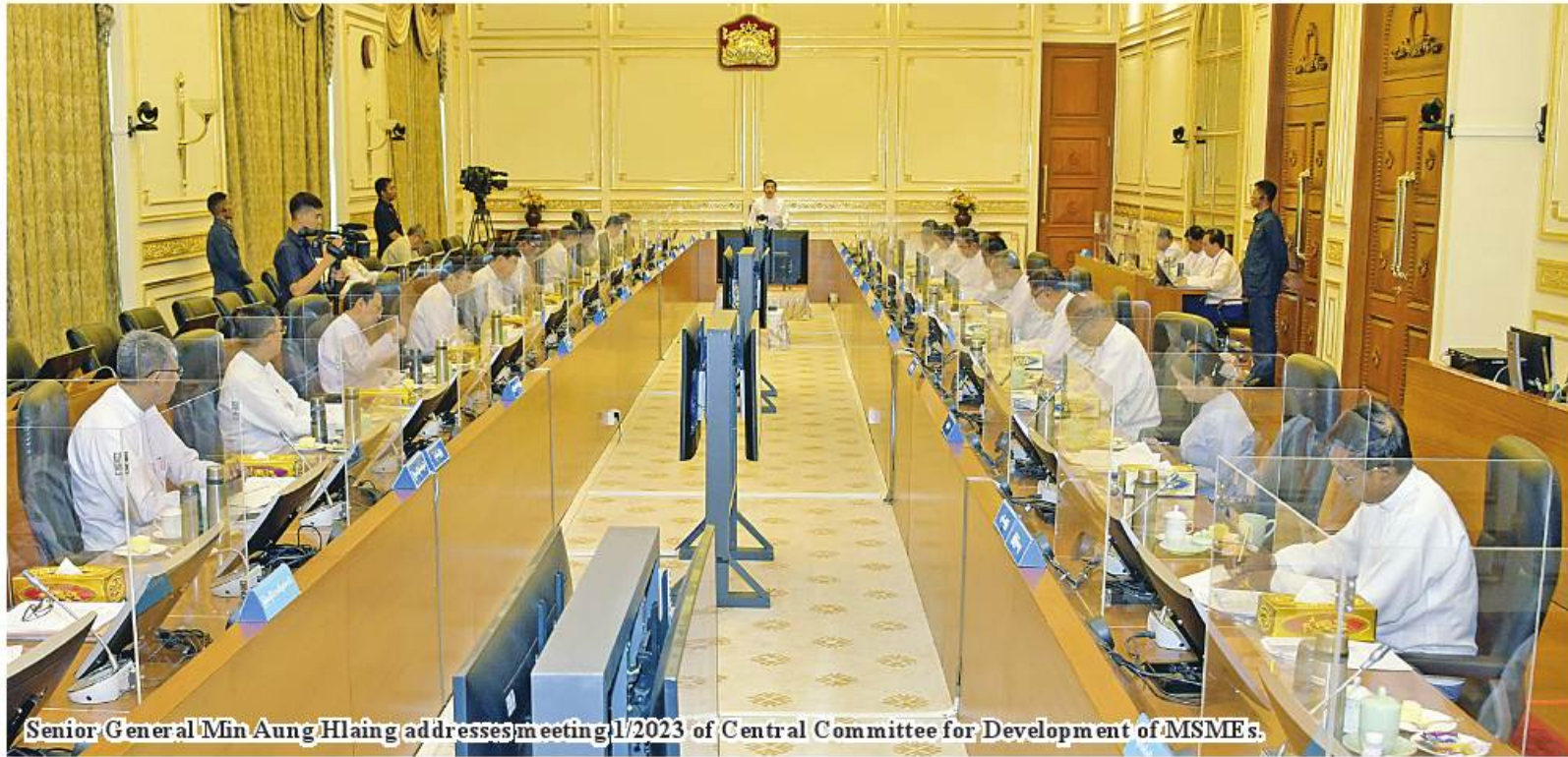
Senior General Min Aung Hlaing addresses meeting 1/2023 of Central Committee for Development of MSMEs.