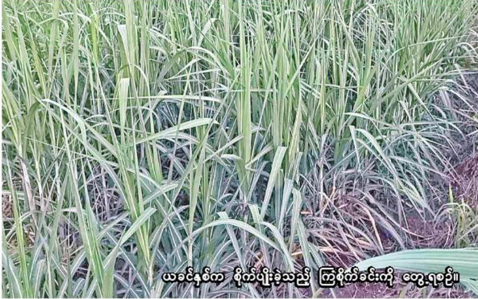
ယခင်နှစ်က စိုက်ပျိုးခဲ့သည့် ကြံစိုက်ခင်းကို တွေ့ရစဉ်။