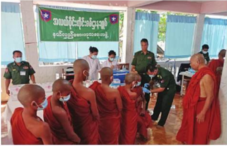
သံဃာတော်များအား နယ်လှည့်ဆေးကုသရေးအဖွဲ့က ကျန်းမာရေးစောင့်ရှောက်မှု လုပ်ငန်းများဆောင်ရွက်ပေးစဉ်။

နေပြည်တော် မေ ၂၇ မြို့နယ်အတွင်းရှိ ဆရာတော်၊ သံဃာ ရောဂါတိုင်းဒေသကြီး လပွတ္တာ တော်များနှင့် ဒေသခံပြည်သူများကို