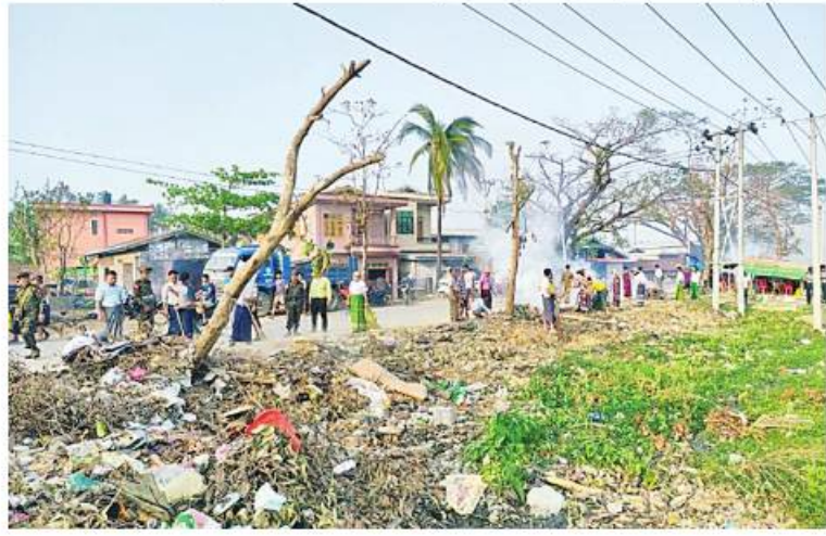
သဘာဝဘေးအန္တရာယ်ကျရောက်သောဒေသများတွင် တပ်မတော်မှ ကူညီကယ်ဆယ်ရေးအဖွဲ့များက ကူညီကယ်ဆယ်ရေးနှင့် ပြန်လည်ထူထောင်ရေးလုပ်ငန်းများ ပူးပေါင်းပါဝင်ဆောင်ရွက်ပေးစဉ်။

လျက်ရှိသည်။ အလားတူ ဘူးသီးတောင်မြို့သို့ ရောက်ရှိနေသော ကူညီကယ်ဆယ်ရေးအဖွဲ့များသည် အဆိုပါမြို့ရှိ လမ်းများကို သန့်ရှင်းရေးဆောင်ရွက်ခြင်းနှင့် သောက်သုံးရေများ ပြန့်ဝေပေးခြင်းများကို ဆောင်ရွက်သည်။ ထို့အတူ မြောက်ဦးမြို့သို့ရောက်ရှိနေသည့် ကူညီကယ်ဆယ်ရေးအဖွဲ့များသည် ကူညီကယ်ဆယ်ရေး ဆောင်ရွက်ပေးနေသော ဝိနီမာရ်အောင်ဘုရားအတွင်းရှိ သစ်ပင်ကြီးများ လဲကျနေသောသစ်ကိုင်းများကို ခုတ်ထွင်ရှင်းလင်းခြင်းလုပ်ငန်းများ ဆောင်ရွက်ပေးလျက်ရှိသည်။