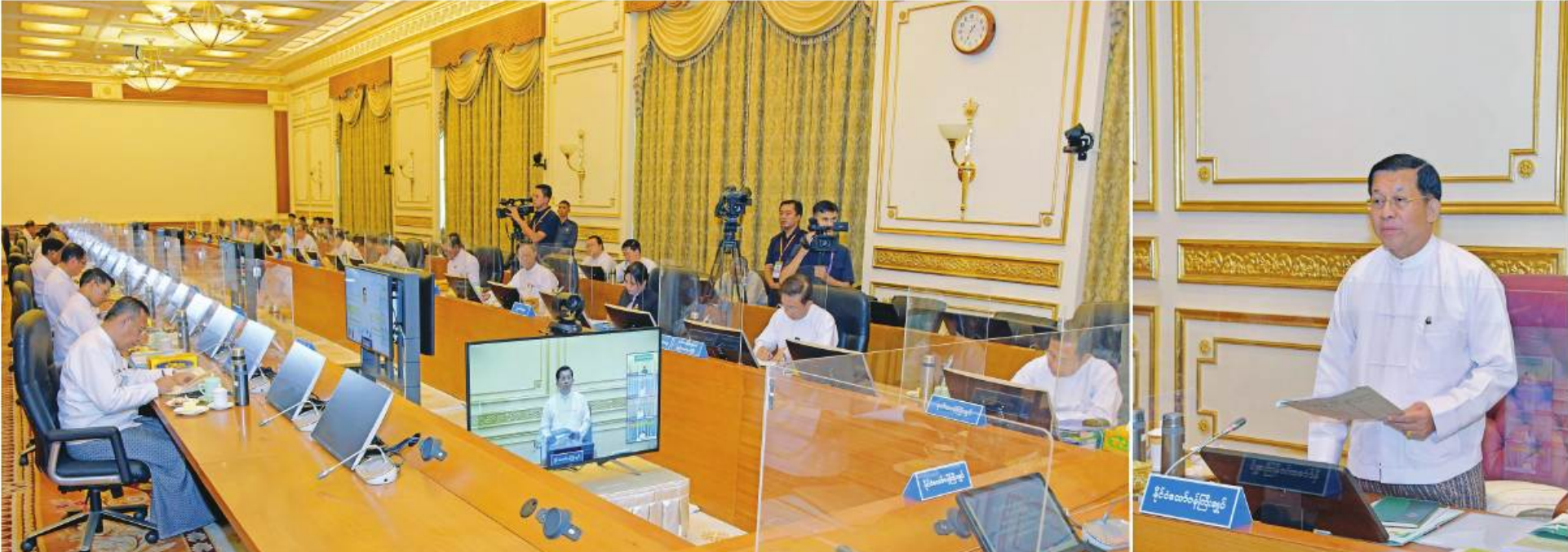
အသေးစား၊ အငယ်စားနှင့် အလတ်စားစီးပွားရေးလုပ်ငန်းများဖွံ့ဖြိုးတိုးတက်ရေးပဟိုကော်မတီဥက္ကဋ္ဌ နိုင်ငံတော်စီမံအုပ်ချုပ်ရေးကောင်စီဥက္ကဋ္ဌ နိုင်ငံတော်ဝန်ကြီးချုပ် ပိုလ်ချုပ်မှူးကြီးမင်းအောင်လှိုင် အသေးစား၊ အငယ်စားနှင့် အလတ်စားစီးပွားရေးလုပ်ငန်းများဖွံ့ဖြိုးတိုးတက်ရေးပဟိုကော်မတီ အစည်းအဝေးအမှတ်စဉ်(၁/၂၀၂၃)တွင် အမှာစကားပြောကြားစဉ်။

နေပြည်တော် မေ ၂၇ အသေးစား၊အငယ်စားနှင့်အလတ်စား စီးပွားရေးလုပ်ငန်းများဖွံ့ဖြိုးတိုးတက်ရေး ပဟိုကော်မတီအစည်းအဝေးအမှတ်စဉ် (၁/၂၀၂၃)ကို ယနေ့မနက်လွဲပိုင်းတွင် နေပြည်တော်ရှိ နိုင်ငံတော်စီမံအုပ်ချုပ်ရေးကောင်စီဥက္ကဋ္ဌရုံး အစည်းအဝေးခန်းမ၌ ကျင်းပရာ အသေးစား၊ အငယ်စားနှင့် အလတ်စားစီးပွားရေးလုပ်ငန်းများ ဖွံ့ဖြိုးတိုးတက်ရေးပဟိုကော်မတီ ဥက္ကဋ္ဌ နိုင်ငံတော်စီမံအုပ်ချုပ်ရေးကောင်စီဥက္ကဋ္ဌ နိုင်ငံတော်ဝန်ကြီးချုပ် ပိုလ်ချုပ်မှူးကြီးမင်းအောင်လှိုင် တက်ရောက်အမှာစကားပြောကြားသည်။ အစည်းအဝေးသို့ အသေးစား၊အငယ်စားနှင့် အလတ်စားစီးပွားရေးလုပ်ငန်းများ ဖွံ့ဖြိုးတိုးတက်ရေးပဟိုကော်မတီ ဒုတိယဥက္ကဋ္ဌ နိုင်ငံတော်စီမံအုပ်ချုပ်ရေးကောင်စီဒုတိယဝန်ကြီးချုပ် ဒုတိယပိုလ်ချုပ်မှူးကြီးစိုးဝင်း၊ ဒုတိယဝန်ကြီးချုပ်နှင့် ပြည်ထောင်စုဝန်ကြီးဦးဝင်းရှိန်၊ ပြည်ထောင်စုဝန်ကြီးများ၊ နေပြည်တော်ကောင်စီဥက္ကဋ္ဌ၊