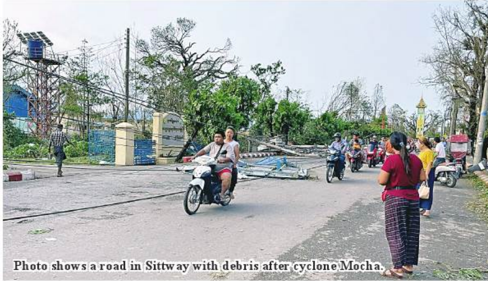
Photo shows a road in Sittway with debris after cyclone Mocha.