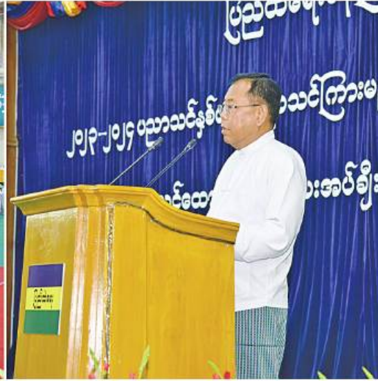
နိုင်ငံတော်စီမံအုပ်ချုပ်ရေးကောင်စီအဖွဲ့ဝင် ဒုတိယဝန်ကြီးချုပ်နှင့်ပြည်ထဲရေးဝန်ကြီးဌာန ပြည်ထောင်စုဝန်ကြီး ဒုတိယဗိုလ်ချုပ်ကြီးမှူးထွဋ် ပြည်ထောင်စုဝန်ကြီးရုံးနှင့် တပ်ဖွဲ့၊ ဦးစီးဌာနများမှ တပ်ဖွဲ့ဝင်၊ ဝန်ထမ်းမိသားစုများ၏ သားသမီး ကျောင်းသား၊ ကျောင်းသူများကို ပညာသင်ထောက်ပံ့ကြေးပေးအပ်ပွဲအစမ်းအနားတွင် အမှာစကားပြောကြားစဉ်။

နေပြည်တော် မေ ၂၇ ၂၀၂၃-၂၀၂၄ ပညာသင်နှစ်တွင် ပညာသင်ကြားမည့် ပြည်ထဲရေးဝန်ကြီးဌာန ပြည်ထောင်စုဝန်ကြီးရုံးနှင့် တပ်ဖွဲ့၊ ဦးစီးဌာနများမှ တပ်ဖွဲ့ဝင်၊ ဝန်ထမ်းများ၏ သားသမီး၊ ကျောင်းသား၊ ကျောင်းသူများအား ပညာသင်ထောက်ပံ့ကြေးပေးအပ်ပွဲ အစမ်းအနားကို ယနေ့ညနေ ၃ နာရီတွင်