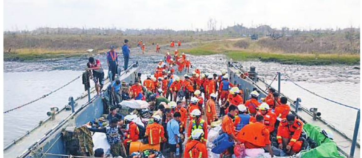
ရခိုင်ပြည်နယ်အတွင်းရှိ မုန်တိုင်းဒဏ်သင့်ပြည်သူများအတွက် ထောက်ပံ့ရေးနှင့် ကူညီကယ်ဆယ်ရေးပစ္စည်းများနှင့် ကမ်းဆယ်ရေးအဖွဲ့ဝင်များကို တပ်မတော်(ရေ)မှ စစ်ရေယာဉ်များဖြင့် ပို့ဆောင်ပေးစဉ်။

နေပြည်တော် မေ ၂၇ ရခိုင်ပြည်နယ်အတွင်းရှိ မုန်တိုင်းဒဏ်သင့်ပြည်သူများအတွက် လိုအပ်သော ကူညီထောက်ပံ့ရေးပစ္စည်းများ၊ စားသောက်ဖွယ်ရာများ ပြန်လည်ထူထောင်ရေးပစ္စည်းများနှင့် ကူညီကယ်ဆယ်ရေးအဖွဲ့များကို တပ်မတော်(ရေ)မှ စစ်ရေယာဉ်များဖြင့် နေရာအသီးသီးသို့ ပို့ဆောင်ဖြန့်ဝေပေးလျက်ရှိသည်။ ထိုသို့ ဆောင်ရွက်ပေးလျက်ရှိရာ ယနေ့တွင်လည်း တပ်မတော်(ရေ)မှ ၅၆ မီတာ ကမ်းထိုးရေယာဉ်ပထမအစီးသည် MV.Sunshine ရေယာဉ်မှ သွားတိုက်တံအချောင်း ၄၆၀၀၊ သွားတိုက်ဆေး ၂၅ ဂရမ်ဘူး ၁၂၀၀၊ သွားတိုက်ဆေး ၇၅ ဂရမ်ဘူး ၁၂၀၀၊ လီတာ၂၀ ရေသန့်ဘူးခွဲ အလုံး ၅၀၊ MV.Forture ရေယာဉ်မှ သွပ် ၁၉၈၂၅ ချပ်၊ သံဖာ ၃၂၀၊ တာပေါ်လင်လိပ် ၁၂၀၊ မိုးကာတံ အလုံး ၄၀၊ ကြက်ဥအလုံး ၇၉၂၀၊ MRTV စလောင်း အလုံး ၅၀၊ ခေါက်ဆွဲခြောက် ၂၅၉ ဖာ၊ အိမ်သာကမုတ် ၉၄၆ ခု၊ ပိုက်အချောင်း ၉၅၀၊ GE သွပ်များ၊ အိမ်ရိုက်သံ၊ အမိုးရိုက်သံ၊ ဒီဇယ်ဆီ စုစုပေါင်းကုန်တန်ချိန် ၁၉၄ ဒသမ ၅ တန်