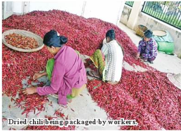
Dried chili being packaged by workers.

in Ayeyawady Region, Shan State, Magway, Ngaphe, Thazi, Kyaukse, Kume, Myittha, Hanmyintmo, Yamethin and Monywa. 185