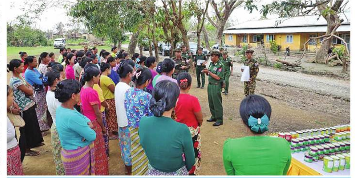
ကာကွယ်ရေးဦးစီးချုပ်ရုံး(ကြည်း)မှ ဒုတိယဗိုလ်ချုပ်ကြီးဖုန်းမြတ် တပ်နယ်မိသားစုဝင်များကို ရင်းရင်းနှီးနှီးလိုက်လံနွှတ်ဆက်စဉ်။

ဆောင်ရွက်ရာတွင် အချိန်မီပြီးစီးစေရေး၊ ယာယီနေထိုင်နိုင်ရန်အတွက် သတ်မှတ် အဆောက်အအုံနေရာများကို အမြန်ဆုံး အကောင်အထည်ဖော်ဆောင်ရွက်နိုင်ရေး၊ သုံးရေရရှိရေးနှင့် ကျန်းမာရေးကောင်းမွန် စွာနေထိုင်နိုင်ရေးတို့အတွက် မှာကြားကာ လုပ်ငန်းများအချိန်မီပြီးစီးစေရေးအတွက် လိုအပ်သည်များကို တာဝန်ရှိသူများနှင့် ပေါင်းစပ်ညှိနှိုင်း ဆောင်ရွက်ပေးသည်။ ထို့နောက်တပ်နယ်အသီးသီးရှိ တပ်မတော် သား မိသားစုဝင်များနှင့် ကျောင်းသား၊ ကျောင်းသူများကိုတွေ့ဆုံပြီး စားသောက် ဖွယ်ရာများနှင့် ကျောင်းသုံးပစ္စည်းများကို ထောက်ပံ့ပေးအပ်ကာ မိသားစုဝင်များကို ရင်းရင်းနှီးနှီး လိုက်လံနွှတ်ဆက်ခဲ့ကြောင်း သတင်းရရှိသည်။