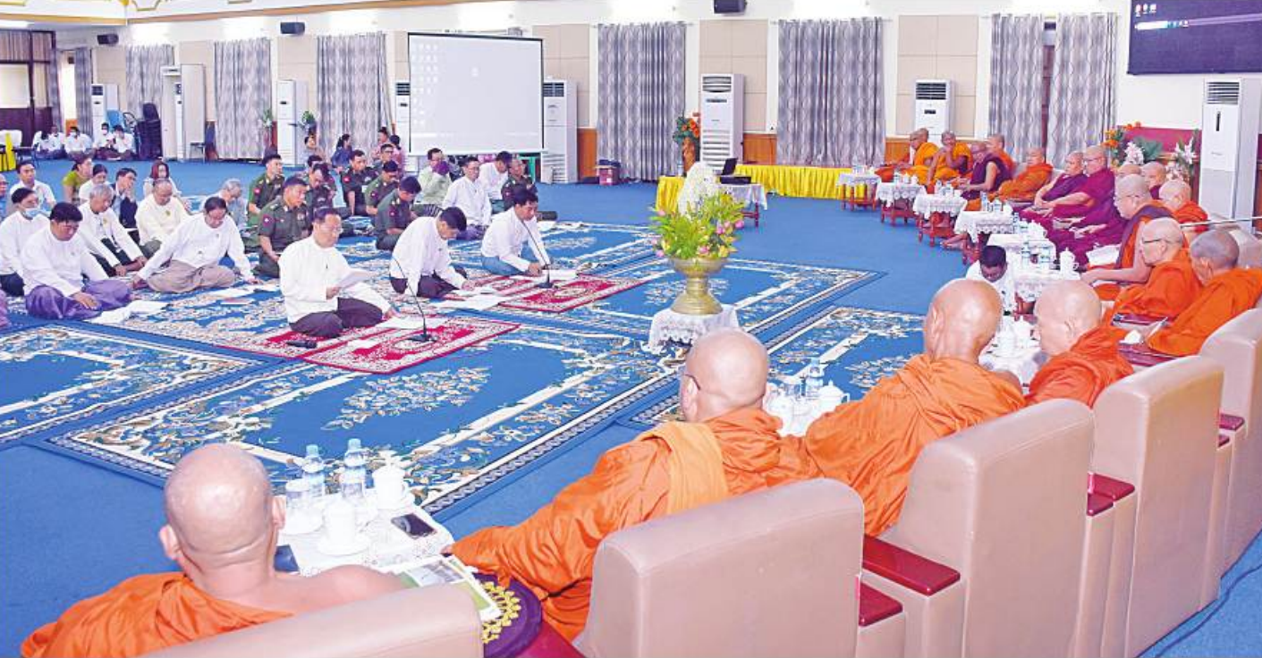
နိုင်ငံတော်သံသမဟာနာယကအဖွဲ့ ဥက္ကဋ္ဌ ပန်းမော်ဆရာတော်ဘုရားကြီး၏ အန္တိမအဂ္ဂိဈာပနပုဏ္ဏားသဘင်ကို နိုင်ငံတော်အဆင့် ခမ်းခမ်းနားနားကျင်းပသွားမည်လုပ်ငန်းညှိနှိုင်းအစည်းအဝေး ကျင်းပစဉ်။

နေပြည်တော် မေ ၂၇ နိုင်ငံတော်သံသမဟာနာယကအဖွဲ့ ဥက္ကဋ္ဌ မန္တလေးတိုင်းဒေသကြီး မဟာအောင်မြေမြို့နယ် မဟာနွယ်စဉ်ရပ်ကွက် ဗန်းမော်ကျောင်းတိုက်ကြီး ၏ပဓာနနာယကဆရာတော် အဘိဓဇမဟာရဋ္ဌဂုရု အဘိဓဇအဂ္ဂမဟာသဒ္ဓမ္မဇောတိက ဒေါက်တာဘဒ္ဒန္တ ကုမာရာဘိဝံသမဟာထေရ်မြတ်ကြီး၏ အန္တိမအဂ္ဂိဈာပန ပုဏ္ဏားသဘင်အခမ်းအနားကျင်းပမည့်