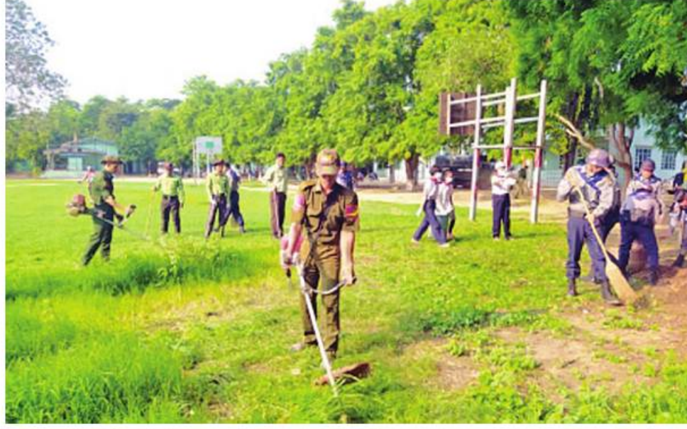
နေပြည်တော် ကောင်စီနယ်မြေ ပုဗ္ဗသီရိမြို့နယ် အမှတ် (၁၃) အခြေခံပညာ အထက်တန်း ကျောင်း၌ စုပေါင်း သန့်ရှင်းရေး ဆောင်ရွက်နေစဉ်

နေပြည်တော် မေ ၂၇ မိမိတို့၏ နေ့စဉ်လူမှုဘဝ နေထိုင် ပြတ်သန်းရာတွင် ကျန်းမာရွှင်လန်းသော လူမှုပတ်ဝန်းကျင်ကို ပိုင်ဆိုင်နိုင်ရေးအတွက် ကိုယ်စိတ်နှလုံးချမ်းမြေ့ဖွယ်ရာ မျက်စိပညာအဖြစ်ပြီး ကျန်းမာရေးနှင့် ညီညွတ်သည့် ပတ်ဝန်းကျင်တစ်ခုရှိရန် အလွန်လိုအပ်ကြောင်းလှည့်လည် မိမိတို့ တစ်ဦးချင်းနေထိုင်ကြသည့် ပတ်ဝန်းကျင် သန့်ရှင်းသပ်ရပ်နေမှသာလျှင် သန့်ရှင်းသာယာလှပသော မြို့ရွာ Clean City၊ Clean Village များ ဖြစ်လာမည်ဖြစ်ပြီး ကျန်းမာရေးနှင့် ညီညွတ်မျှတမည်ဖြစ်သည်