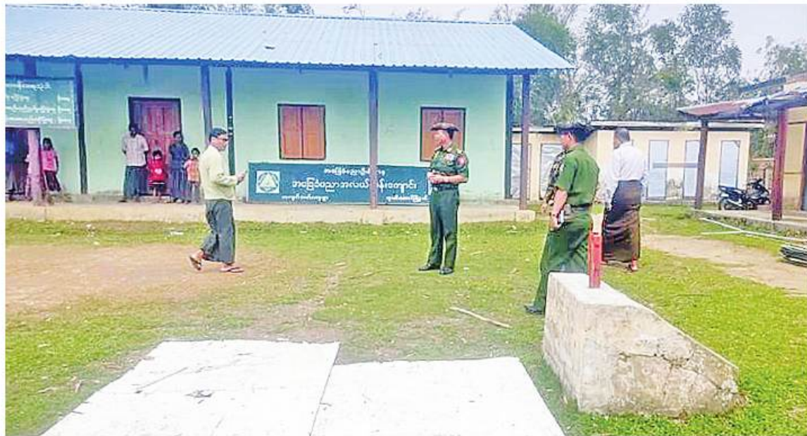
ကာကွယ်ရေးဦးစီးချုပ်ရုံး(ကြည်း)မှ ဒုတိယဗိုလ်ချုပ်ကြီးအေးဝင်း သူးသီးတောင်မြို့နယ်ရှိ ပျက်စီးခဲ့သည့် စာသင်ကျောင်းများကို ကြည့်ရှုစစ်ဆေးစဉ်

နေပြည်တော် မေ ၂၄ နိုင်ငံတော်စီမံအုပ်ချုပ်ရေး ကောင်စီ အနေဖြင့် ဆိုင်ကလုန့်မုန်တိုင်း(မိုခါ) တိုက်ခတ်မှုကြောင့် ထိခိုက်ပျက်စီးခဲ့သည့် ဒေသများကို သဘာဝဘေးအန္တရာယ် ဆိုင်ရာစီမံခန့်ခွဲမှုဥပဒေပုဒ်မ ၁၁ အရ သဘာဝဘေးအန္တရာယ် ကျရောက်သော ဒေသများအဖြစ်ကြေညာချက်များထုတ်ပြန်၍ ယင်းကြေညာချက်များပါ ဒေသများတွင် ပြန်လည်ထူထောင်ရေးလုပ်ငန်းများဆောင်ရွက်နိုင်ရန် ဒေသအလိုက် တပ်မတော် အရာရှိကြီးများကို ခန့်အပ်တာဝန်ပေးထားပြီးဖြစ်သည်။ ထိုသို့ပြန်လည်ထူထောင်ရေးလုပ်ငန်းများဆောင်ရွက်ရန်အတွက် ခန့်အပ်တာဝန်ပေးအပ်ထားရှိရာ ယနေ့တွင် ဘူးသီးတောင်မြို့သို့ရောက်ရှိနေသော ကာကွယ်ရေးဦးစီးချုပ်ရုံး(ကြည်း)မှ ဒုတိယဗိုလ်ချုပ်ကြီးအေးဝင်းသည် တာဝန်ရှိသူများနှင့်အတူ မုန်တိုင်းတိုက်ခတ်မှုကြောင့် ပျက်စီးသွားခဲ့သည့် စာသင်ကျောင်းများကို လိုက်လံကြည့်ရှုစစ်ဆေးပြီး လိုအပ်သည်များညှိနှိုင်းဆောင်ရွက်ပေးသည်။ ထို့နောက် လေဘေးသင့်ပြည်သူများကို နယ်လှည့်ဆေးကုသရေးအဖွဲ့က ကျန်းမာရေးစောင့်ရှောက်မှုလုပ်ငန်း ဆောင်ရွက်နေမှုများနှင့် သောက်သုံးရေ ဖြန့်ဝေပေးနေမှုများကို သွားရောက်ကြည့်ရှုပြီး စားသောက်ဖွယ်ရာများထောက်ပံ့ပေးအပ်သည်။