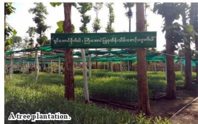
A tree plantation.

happens. Now, the government reestablishes forests annually, according to the Magway Region Forest Department. Po Htet (Minbu)