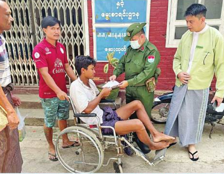
နယ်မြေခံလုံခြုံရေးတပ်ဖွဲ့မှ တာဝန်ရှိသူတစ်ဦးက ထိခိုက်ဒဏ်ရာရရှိခဲ့သည့် ခရီးသွားပြည်သူတစ်ဦးကို ထောက်ပံ့ပေးအပ်စဉ်

နေပြည်တော် မေ ၂၄ တရားမဲ့စွာ အကြောင်းမဲ့ပစ်ခတ်တိုက်ခိုက်ခဲ့သဖြင့် အပြစ်မဲ့ခရီးသွားပြည်သူနှစ်ဦး သေဆုံးခဲ့ပြီး သုံးဦး ထိခိုက်ဒဏ်ရာများ ရရှိခဲ့ကြောင်း သိရသည်။ စီးနင်းလိုက်ပါလာသည့် ခရီးသွားမော်တော် ဖြစ်စဉ်မှာ မြိတ်-ထားဝယ်ဆက်သွယ် ယာဉ်ကို လက်နက်ငယ်များဖြင့် ဆင်ခြင်တိုက်ခတ်ခဲ့သည့် လမ်းကြောင်းပေါ်ရှိ ပုလော