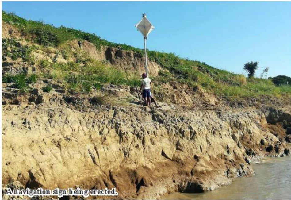
A navigation sign being erected.

Mandalay May 24 A plan is underway to erect 200 navigation signs along Mandalay-Tagaung waterway in Ayeyawady River as from 17 May, said