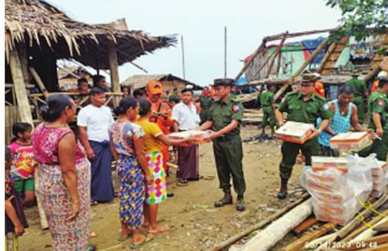
အရှေ့တောင်တိုင်းစစ်ဌာနချုပ်မှ တာဝန်ရှိသူတစ်ဦးက လေဘေးသင့်ပြည်သူများကို ထောက်ပံ့ပစ္စည်းများပေးအပ်စဉ်။

နေပြည်တော် မေ ၂၄ မွန်ပြည်နယ် သံဖြူဇရပ်မြို့နယ် စက်စဲ ကျေးရွာအုပ်စု ရသေ့တောင်ကျေးရွာနှင့် ပတ်ဝန်းကျင်တစ်ဝိုက်၌ ယနေ့နံနက် ၃ နာရီ ၄၅ မိနစ်မှ ၄ နာရီထိ တစ်နာရီလျှင် ပျမ်းမျှလေတိုက်နှုန်း မိုင် ၃၀ ခန့်ဖြင့် လေပြင်းတိုက်ခတ်မှုဖြစ်ပွားခဲ့ပြီး ပျက်စီး ဆုံးရှုံးမှုများဖြစ်ပေါ်ခဲ့ကြောင်း သိရသည်။ အဆိုပါ လေပြင်းတိုက်ခတ်မှုကြောင့် ရသေ့တောင်ကျေးရွာနှင့် ပတ်ဝန်းကျင် တစ်ဝိုက်ရှိ ဘုန်းတော်ကြီးကျောင်း တစ်ကျောင်း၊ လူနေအိမ် ၂၁ လုံးတို့မှာ အမိုးလန်၍ ပြိုကျပျက်စီးခြင်းများဖြစ်ပေါ် ခဲ့သဖြင့် အရှေ့တောင်တိုင်းစစ်ဌာနချုပ်မှ နယ်မြေခံတပ်မတော်သားများ၊ မြန်မာနိုင်ငံ