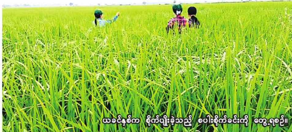
ယခုနှစ်က စိုက်ပျိုးခဲ့သည့် စပါးစိုက်ခင်းကို တွေ့ရစဉ်။

ရွှေဘို မေ ၂၄ စစ်ကိုင်းတိုင်းဒေသကြီး ရွှေဘိုခရိုင် ရွှေဘိုမြို့နယ်တွင် ယခုနှစ် မိုးသီးနှံစိုက်ပျိုးရာသီ၌ မိုးစပါးဧက ၁၁၃၉၀၀ စိုက်ပျိုးသွားမည်ဖြစ်ကြောင်း ရွှေဘိုမြို့နယ် စိုက်ပျိုးရေးဦးစီးဌာနမှ သိရသည်။ ၂၀၂၂ ခုနှစ် မိုးသီးနှံစိုက်ပျိုး