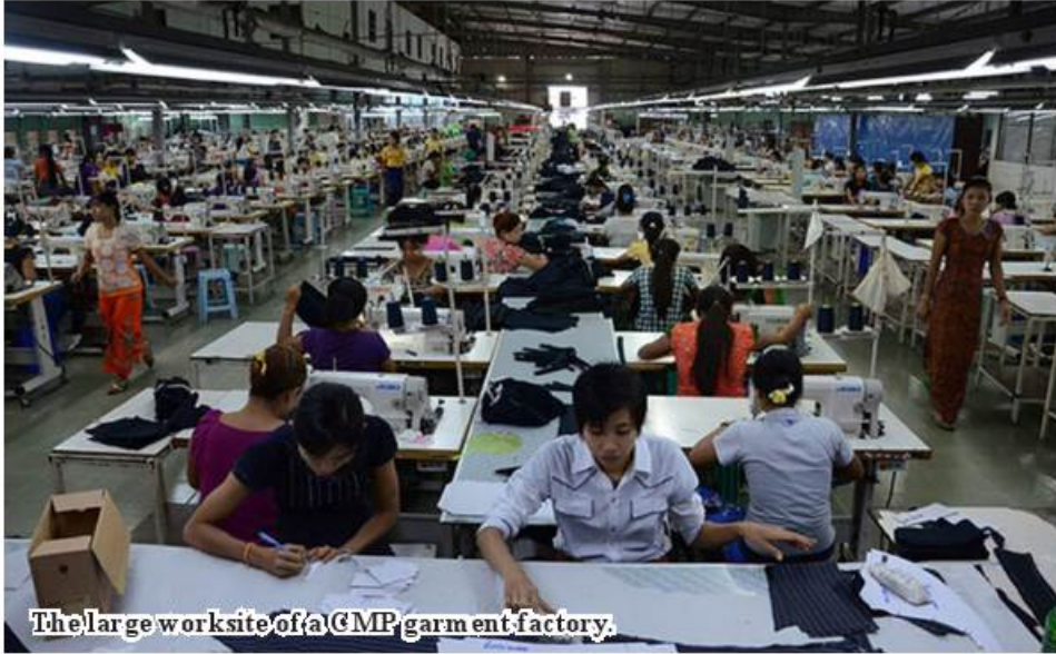
The large worksite of a CMP garment factory.