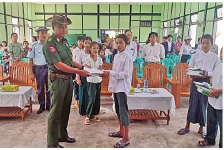
အနောက်တောင်တိုင်းစစ်ဌာနချုပ်မှ တာဝန်ရှိသူတစ်ဦးက ကျောင်းသား၊ ကျောင်းသူ များကို စာရေးကိရိယာများပေးအပ်စဉ်။

နေပြည်တော် မေ ၂၄ နိုင်ငံရေးပါတီတည်ထောင်လိုသူများက ယင်းတို့တည်ထောင်လိုသော ပါတီ အမည်ကိုဖော်ပြ၍ ပြည်ထောင်စုရွေးကောက်ပွဲကော်မရှင်သို့ လျှောက်ထားလျက်ရှိကြရာ ယနေ့ထိ ပါတီတည်ထောင်ခွင့်လျှောက်ထားလာသည့်အဖွဲ့ ၁၃ ဖွဲ့ရှိပြီး ယင်းသို့ လျှောက်ထားသည့်အဖွဲ့များအနက် အမျိုးသားအကျိုးစီးပွားတိုးတက်ရေးပါတီ သည် နိုင်ငံရေးပါတီများမှတ်ပုံတင်ခြင်းဥပဒေ၊ နည်းဥပဒေများနှင့်ညီညွတ်ကြောင်း စိစစ် တွေ့ရှိရသဖြင့် ကော်မရှင်က ယနေ့တွင် နိုင်ငံရေးပါတီတည်ထောင်ခွင့် လျှောက်ထား ချက်ကို ခွင့်ပြုလိုက်ကြောင်း သိရသည်။ ပါတီတည်ထောင်ခွင့်ရရှိသော အမျိုးသားအကျိုးစီးပွားတိုးတက်ရေးပါတီ သည် ခွင့်ပြုချက်ရရှိသည့်နေ့မှစ၍ ရက်ပေါင်း ၃၀ အတွင်း နိုင်ငံရေးပါတီများမှတ်ပုံတင် ခြင်းနည်းဥပဒေ ၇ နှင့်အညီ ကော်မရှင်သို့ နိုင်ငံရေးပါတီအဖြစ် မှတ်ပုံတင်ပေးပါရန် လျှောက်ထားရမည်ဖြစ်သည်။ ယနေ့ထိ တည်ထောင်ခွင့်ပြုပြီး နိုင်ငံရေးပါတီ ခြောက် ပါတီဖြစ်ကြောင်းနှင့် တည်ထောင်ခွင့်လျှောက်ထားသည့် ကျန်အဖွဲ့များကိုလည်း စိစစ် ဆောင်ရွက်လျက်ရှိကြောင်း သတင်းရရှိသည်။ (သတင်းစဉ်)