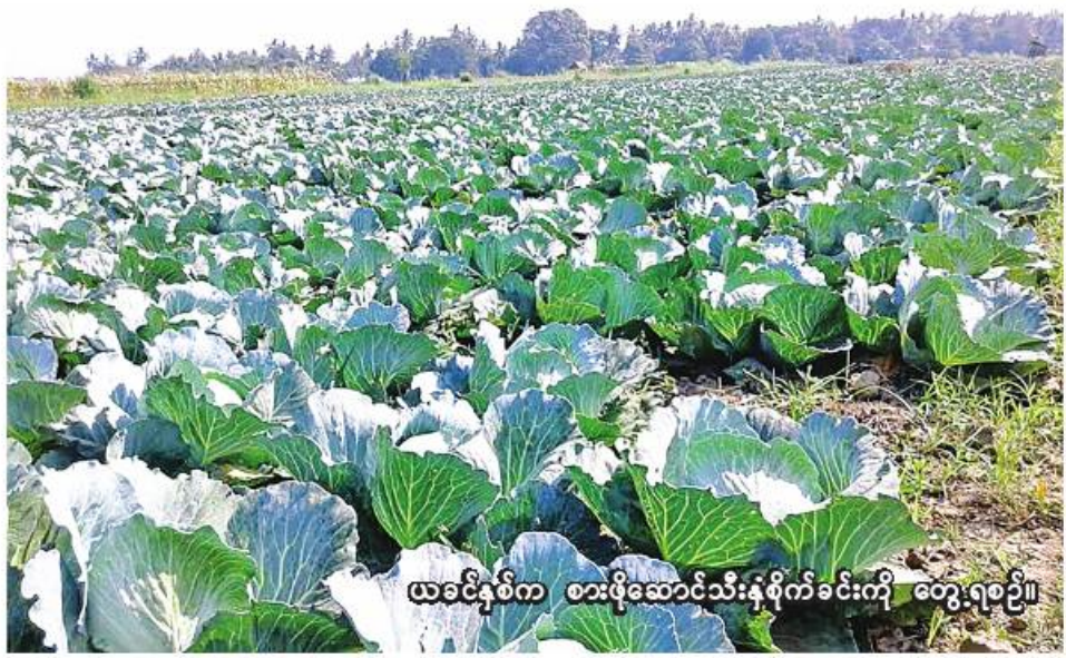
ယခင်နှစ်က စားဖိုဆောင်သီးနှံစိုက်ခင်းကို တွေ့ရစဉ်။