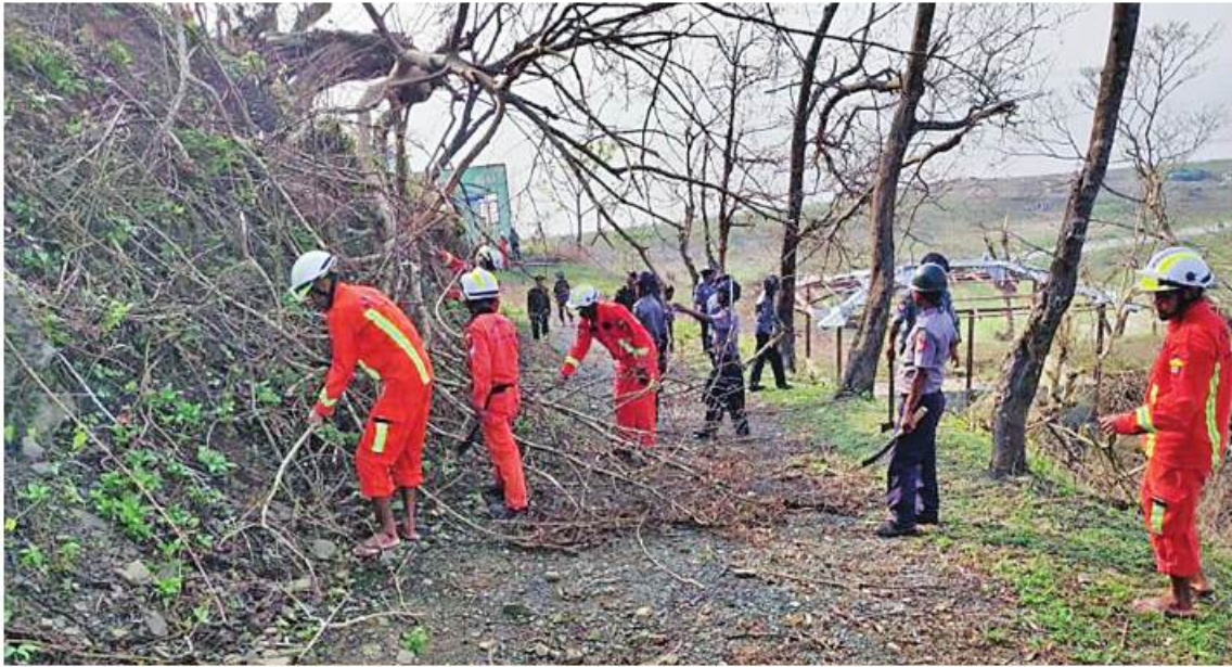
သဘာဝဘေးအန္တရာယ်ကျရောက်သောဒေသများတွင် တပ်မတော်မှ ကူညီကယ်ဆယ်ရေးအဖွဲ့များက ကူညီကယ်ဆယ်ရေးနှင့် ပြန်လည်ထူထောင်ရေးလုပ်ငန်းများ ပူးပေါင်းပါဝင်ဆောင်ရွက်ပေးလျက်ရှိစဉ်။

အမှတ်(၁) အခြေခံပညာအထက်တန်းကျောင်း၌လဲကျနေသော သစ်ပင်ကြီးများကို ခုတ်ထွင်ရှင်းလင်းခြင်းနှင့် သန့်ရှင်းရေးလုပ်ငန်းများ ဆောင်ရွက်ပေးလျက်ရှိသည်။ ထို့ပြင် ကင်းချောင်းကျေးရွာနှင့် ကကျက်ဘတ်ကျေးရွာရှိ လေဘေးသင့်ပြည်သူများကို နယ်လှည့်ဆေးကုသရေးအဖွဲ့မှကျန်းမာရေးစောင့်ရှောက်မှုလုပ်ငန်းများဆောင်ရွက်ပေးပြီး စားသောက်ဖွယ်ရာများနှင့်သောက်ရေသန့်များဖြန့်ဝေပေးလျက်ရှိသည်။