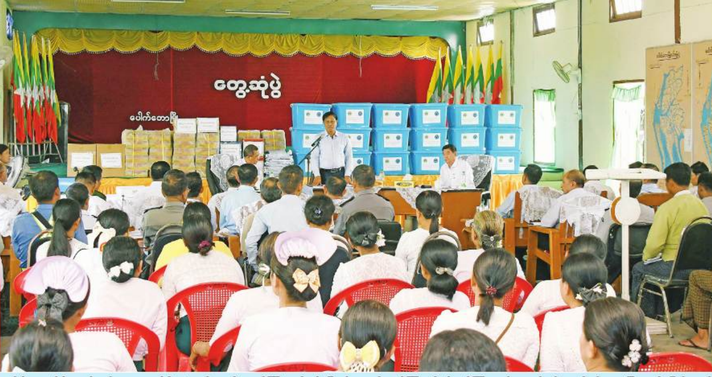
နိုင်ငံတော်စီမံအုပ်ချုပ်ရေးကောင်စီအဖွဲ့ဝင် ဒုတိယဝန်ကြီးချုပ်နှင့် ပြည်ထောင်စုဝန်ကြီး ဗိုလ်ချုပ်ကြီးတင်အောင်စန်း၊ ပေါက်တောမြို့နယ် ပြန်လည်ထူထောင်ရေးလုပ်ငန်းကော်မတီဝင်များ၊ ဌာနဆိုင်ရာဝန်ထမ်းများ၊ မြို့မိမြို့ဖများကို တွေ့ဆုံအမှာစကားပြောကြားစဉ်။

စစ်တွေ မေ ၂၄ နိုင်ငံတော်စီမံအုပ်ချုပ်ရေးကောင်စီ အဖွဲ့ဝင် ဒုတိယဝန်ကြီးချုပ်နှင့် ပြည်ထောင်စုဝန်ကြီး ဗိုလ်ချုပ်ကြီးတင်အောင်စန်း၊ ပြည်ထောင်စုဝန်ကြီး ဒုတိယဗိုလ်ချုပ်ကြီးထွန်းထွန်းနောင်နှင့် ရခိုင်ပြည်နယ်ဝန်ကြီးချုပ် ဦးထိန်လင်းတို့သည် ယနေ့နံနက်