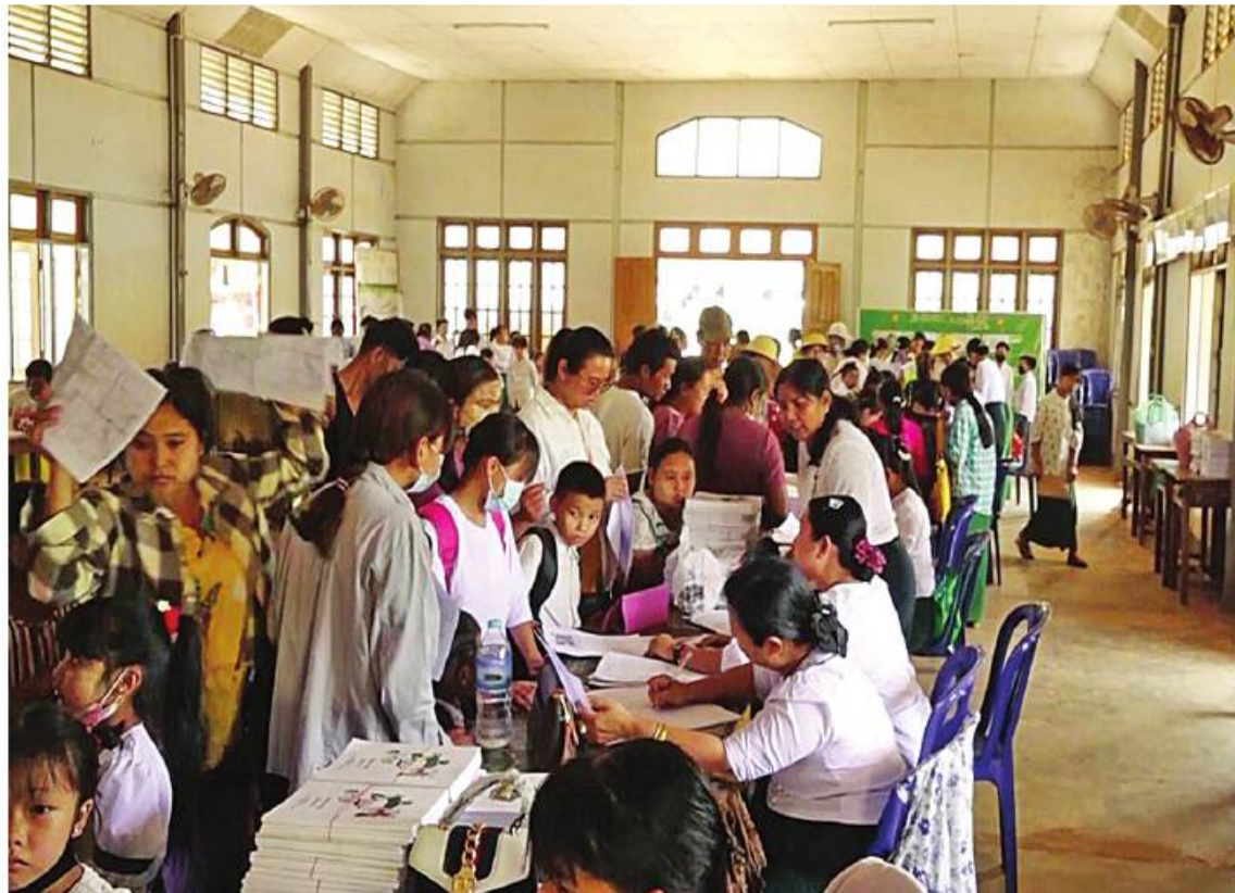
ရခိုင်ပြည်နယ်(မြောက်ပိုင်း)ရှိ အခြေခံပညာကျောင်းများတွင် ကျောင်းသား၊ ကျောင်းသူများကို ကျောင်းအပ်နှံကြစဉ်။

နေပြည်တော် မေ ၂၄ ၂၀၂၃-၂၀၂၄ ပညာသင်နှစ်အတွက် အခြေခံပညာဦးစီးဌာနအောက်ရှိ အထက်တန်းအဆင့်၊ အလယ်တန်းအဆင့်နှင့် မူလတန်းအဆင့် ကျောင်းများကို ဇွန် ၁ ရက်တွင် စတင်ဖွင့်လှစ်မည်ဖြစ်ပြီး ကျောင်းအပ်နှံမှုသီတင်းပတ်အဖြစ် မေ ၂၃ ရက်မှ မေ ၃၁ ရက်ထိ သတ်မှတ်၍ ကျောင်းသားကျောင်းသူများကို ကျောင်းအပ်နှံမှုလက်ခံခြင်းများအား ဆောင်ရွက်သွားမည်ဖြစ်သည်။ မြန်မာနိုင်ငံတစ်ဝန်းရှိ အခြေခံပညာကျောင်းအသီးသီး၌ ကျောင်းအပ်လက်ခံခြင်းများကို မေ ၂၃ ရက် နံနက်ပိုင်းမှ စတင်ဆောင်ရွက်လျက်ရှိပြီး ယနေ့တွင်လည်း တိုင်းဒေသကြီးနှင့် ပြည်နယ်အသီးသီးရှိ အခြေခံပညာကျောင်းများအလိုက် ကျောင်းအပ်ကြီးများ၊ ကျောင်းအုပ်ချုပ်မှုတာဝန်ခံများနှင့် ဆရာ၊ဆရာမများက စာမျက်နှာ ၂၀ ကော်လံ ၄ ☆