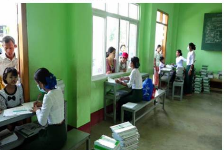
ကချင်ပြည်နယ်အတွင်းရှိ အခြေခံပညာကျောင်းများတွင် ကျောင်းသား၊ ကျောင်းသူများကို ကျောင်းအပ်နှံကြစဉ်။

ကျေးဇူးဖုအဆက် ကျောင်းလားရောက်အပ်နှံသူ မိဘအုပ်ထိန်း နှံ့မှုလက်ခံဆောင်ရွက်သည့် ဆရာ၊ ဆရာမ သူများနှင့် ကျောင်းသား၊ ကျောင်းသူများ အဆင်ပြေချောမွေ့စွာ ကျောင်းအပ်နှံ ကျောင်းသား၊ ကျောင်းသူများနှင့် မိဘ နိုင်ငံရေး ဆောင်ရွက်ပေးကြပြီး ကျောင်း များ၏ လုံခြုံရေးအတွက် သက်ဆိုင်ရာ လုံခြုံရေးတာဝန်ရှိသူများနှင့် တာဝန်သိ ပြည်သူများက ပူးပေါင်းဆောင်ရွက်ပေး လျက်ရှိကြောင်း သိရသည်။ ယင်းသို့ ဆောင်ရွက်ပေးနေမှုများကို တိုင်းဒေသကြီးနှင့် ပြည်နယ်အသီးသီးမှ ဝန်ကြီးချုပ်များ၊ တိုင်းစစ်ဌာနချုပ် အသီးသီးမှ တာဝန်ရှိသူများနှင့် ဌာန ဆိုင်ရာတာဝန်ရှိသူများက သွားရောက် ကြည့်ရှုအားပေးကြပြီး လိုအပ်သည်များ ပေါင်းစပ်ညှိနှိုင်း ဆောင်ရွက်ပေးခဲ့ကြောင်း သတင်းရရှိသည်။