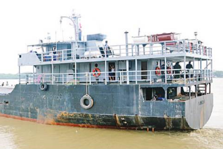
ရခိုင်ပြည်နယ်အတွင်းရှိ သဘာဝဘေးဒဏ်သင့်ပြည်သူများအတွက် ကူညီကယ်ဆယ်ရေးပစ္စည်းများနှင့် စားသောက်ဖွယ်ရာ ပစ္စည်းများကို တပ်မတော်(ရေ)မှ ရေယာဉ်များဖြင့် ဆက်လက်ပို့ဆောင်ပေးစဉ်။

တန်ချိန် ၄၂ တန်ခန့်တို့ကို မင်းဂံကမ်းထိုး ရပ်မှတင်ဆောင်၍ ရသေ့တောင်သို့ လည်းကောင်း၊ ၂၉ မီတာ ကမ်းထိုး ရေယာဉ်တတိယအစီးသည် ဆောက်လုပ် ရေးလုပ်ငန်းသုံး Backhoe သုံးစီး၊ ရိက္ခာထုပ် ၁၉၂ ထုပ်နှင့် စားသောက်ကုန် များ စုစုပေါင်းကုန်တန်ချိန် ၁၁ တန်ခန့် တို့ကိုတင်ဆောင်၍ ရေချမ်းပြင်ကမ်းထိုး ရပ်မှ ရသေ့တောင်ကမ်းထိုးရပ်သို့