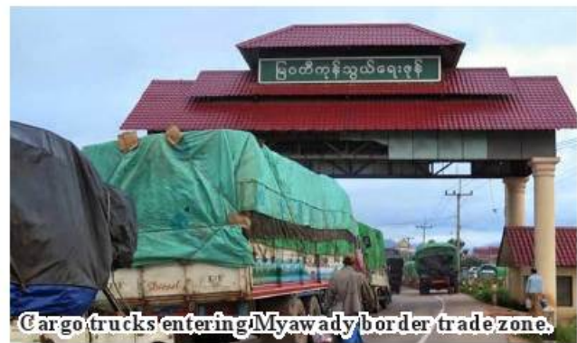
Cargo trucks entering Myawady border trade zone.

Tachilek, Kawthoung, Myeik, Htikhee, Mawtaung and Meisei to do trade with Thailand. ASH