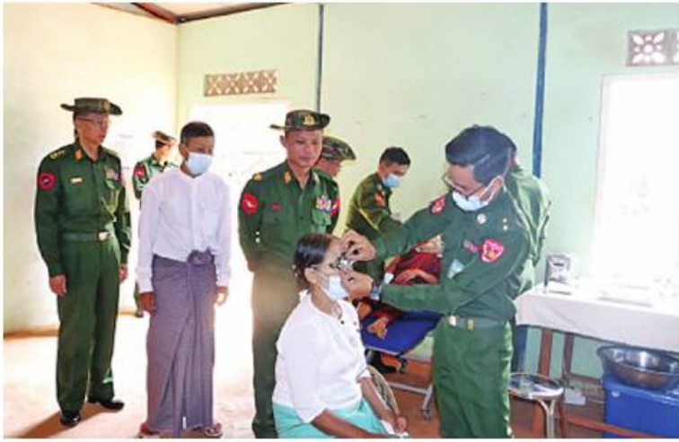
နယ်မြေခံဆေးကုသရေးအဖွဲ့က ဒေသခံပြည်သူများအား ကျန်းမာရေးစောင့်ရှောက်မှုလုပ်ငန်းများ ဆောင်ရွက်ပေးနေမှုကို တာဝန်ရှိသူများက ကြည့်ရှုအားပေးစဉ်။

နေပြည်တော် မေ ၂၄ တိုင်းဒေသကြီးနှင့် ပြည်နယ်များရှိ မြို့ပေါ်ရပ်ကွက်များနှင့် ကျေးရွာများမှ သံဃာတော်များ၊ သာသနာ့ဓမ္မဝင် သီလရှင်များ၊ ဒေသခံပြည်သူများ၊ စစ်မှုထမ်းဟောင်းအဖွဲ့ဝင်များနှင့် ပြည်သူ့စစ်အဖွဲ့ဝင်များကို တိုင်းစစ်ဌာနချုပ် အသီးသီးမှ နယ်မြေခံဆေးကုသရေးအဖွဲ့များက ကျန်းမာရေးစောင့်ရှောက်မှုလုပ်ငန်းများ ဆောင်ရွက်ပေးလျက်ရှိသည်။ ထိုသို့ ဆောင်ရွက်ပေးလျက်ရှိရာ တြိဂံဒေသတိုင်းစစ်ဌာနချုပ် နယ်မြေခံ