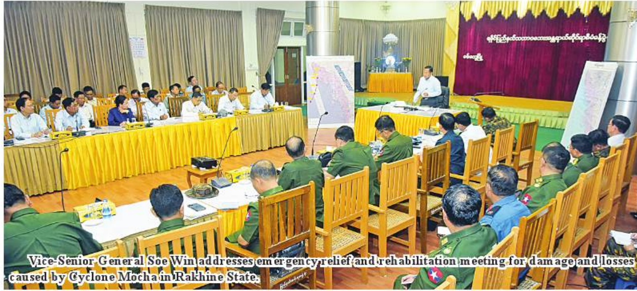
Vice-Senior General Soe Win addresses emergency relief and rehabilitation meeting for damage and losses caused by Cyclone Mocha in Rakhine State.