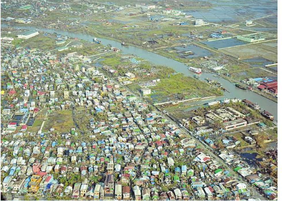
ဆိုင်ကလုန်းမုန်တိုင်း(မိုခါ)ကျရောက်မှုကြောင့် ပျက်စီးဆုံးရှုံးမှုများဖြစ်ပေါ်ခဲ့မှုကိုတွေ့ရစဉ်။