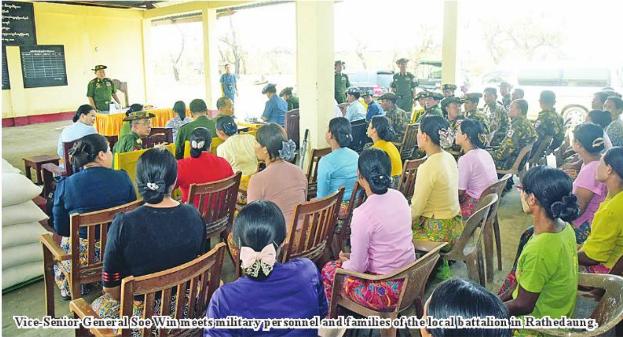
Vice-Senior General Soe Win meets military personnel and families of the local battalion in Rathedaung.