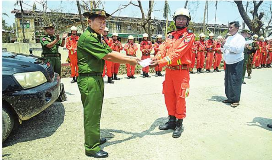
အမျိုးသားသဘာဝဘေးအန္တရာယ်ဆိုင်ရာ စီမံခန့်ခွဲမှုကော်မတီဥက္ကဋ္ဌ နိုင်ငံတော်စီမံအုပ်ချုပ်ရေး ကောင်စီဒုတိယဥက္ကဋ္ဌ ဒုတိယတပ်မတော်ကာကွယ်ရေးဦးစီးချုပ် ကာကွယ်ရေးဦးစီးချုပ်(ကြည်း) ဒုတိယဗိုလ်ချုပ်မှူးကြီးစိုးဝင်းက ရသေ့တောင်မြို့အတွင်း ကူညီကယ်ဆယ်ရေးလုပ်ငန်းများ လာရောက် ဆောင်ရွက်ပေးနေသည့် ပဲခူးတိုင်းဒေသကြီးမှ မြန်မာနိုင်ငံစီးသတ်တပ်ဖွဲ့ဝင်များကို ထောက်ပံ့ပေးပေးအပ်စဉ်။

ကျရောက်ခဲ့ရသည့် ကျောက်တော်မြို့နှင့် ရသေ့တောင်မြို့တို့သို့ သွားရောက်၍ ဆောင်ရွက်ရာတွင်လည်း မြို့နေဒေသခံ များနှင့်အခြေခံပညာကျောင်းများ ပြန်လည် ပြည်သူများနှင့် ဌာနဆိုင်ရာများအနေဖြင့် ဖွင့်လှစ်တော့မည်ဖြစ်သဖြင့် ကျောင်းသား၊ ဦးစီးချုပ်(ကြည်း)က လိုအပ်သည်များ အန္တရာယ်ဆိုင်ရာစီမံခန့်ခွဲမှုဥပဒေပုဒ်မ ၁၁ ပေါင်းစပ်ညှိနှိုင်းဆောင်ရွက်ပေးပြီး မုန်တိုင်း သင့်ပြည်သူများနှင့် စာမျက်နှာ ၂၁ သို့