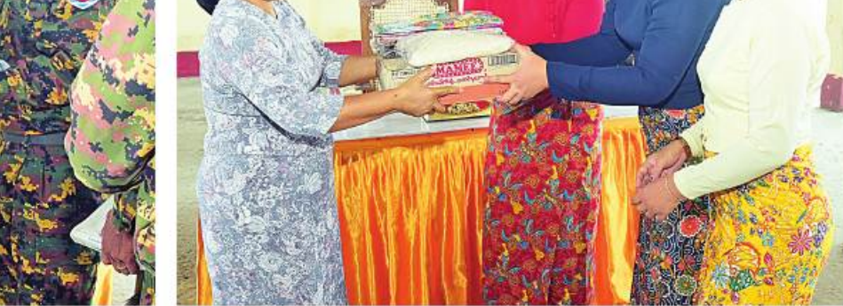
အမျိုးသားသဘာဝဘေးအန္တရာယ်ဆိုင်ရာစီမံခန့်ခွဲမှုကော်မတီဥက္ကဋ္ဌ နိုင်ငံတော်စီမံ အုပ်ချုပ်ရေးကောင်စီဒုတိယဥက္ကဋ္ဌ ဒုတိယတပ်မတော်ကာကွယ်ရေးဦးစီးချုပ် ကာကွယ် ရေးဦးစီးချုပ်(ကြည်း) ဒုတိယဗိုလ်ချုပ်မှူးကြီးစိုးဝင်း သဘာဝဘေးအန္တရာယ်သင့်ခဲ့သည့် ရသေ့တောင်တပ်နယ်မှ အရာရှိ၊ စစ်သည်၊ မိသားစုဝင်များအတွက် ထောက်ပံ့ပစ္စည်းများ ပေးအပ်စဉ်။

ဦးစီးချုပ်(ကြည်း)က လိုအပ်သည်များ အန္တရာယ်ဆိုင်ရာစီမံခန့်ခွဲမှုဥပဒေပုဒ်မ ၁၁ ပေါင်းစပ်ညှိနှိုင်းဆောင်ရွက်ပေးပြီး မုန်တိုင်း သင့်ပြည်သူများနှင့် စာမျက်နှာ ၂၁ သို့