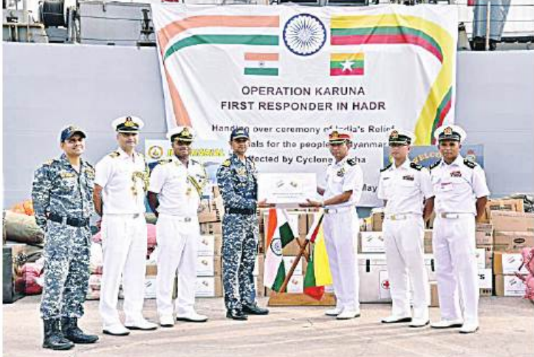
အိန္ဒိယရေတပ်၏ စစ်ရေယာဉ် INS Gharial မှ ကူညီကယ်ဆယ်ရေးပစ္စည်းများနှင့် စားသောက်ဖွယ်ရာများကို သက်ဆိုင်ရာတာဝန်ရှိသူများထံသို့ လွှဲပြောင်းပေးအပ်စဉ်။

နေပြည်တော် မေ ၁၉ ရခိုင်ကမ်းရိုးတန်းဒေသသို့ အလွန် အလွန်အားကောင်းသော ဆိုင်ကလွန်းမုန် တိုင်းမိုခါ(MOCHA)ဖြတ်သန်းတိုက်ခတ် မှုကြောင့် ထိခိုက်ပျက်စီးဆုံးရှုံးမှုများဖြစ် ပေါ်ခဲ့သော တိုင်းဒေသကြီးပြည်နယ်များရှိ ရပ်ကွက်၊ ကျေးရွာများမှ မုန်တိုင်းဒဏ်သင့် ပြည်သူများကို ကူညီကယ်ဆယ်ရေးနှင့် ပြန်လည်ထူထောင်ရေးလုပ်ငန်းများဆောင် ရွက်ရာတွင် အသုံးပြုနိုင်ရန်အတွက် အိန္ဒိယ နိုင်ငံမှ လူသားချင်းစာနာထောက်ထားမှု ဆိုင်ရာအကူအညီများပေးအပ်ရန် ကူညီ ကယ်ဆယ်ရေးပစ္စည်းများနှင့် စားသောက် ဖွယ်ရာများတင်ဆောင်လာသော အိန္ဒိယ ရေတပ်မှ စစ်ရေယာဉ် INS Gharial