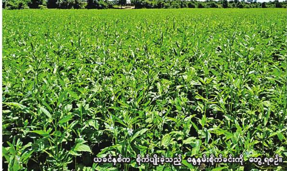
ယခင်နှစ်က စိုက်ပျိုးခဲ့သည့် နွေနှမ်းစိုက်ခင်းကို တွေ့ရစဉ်။