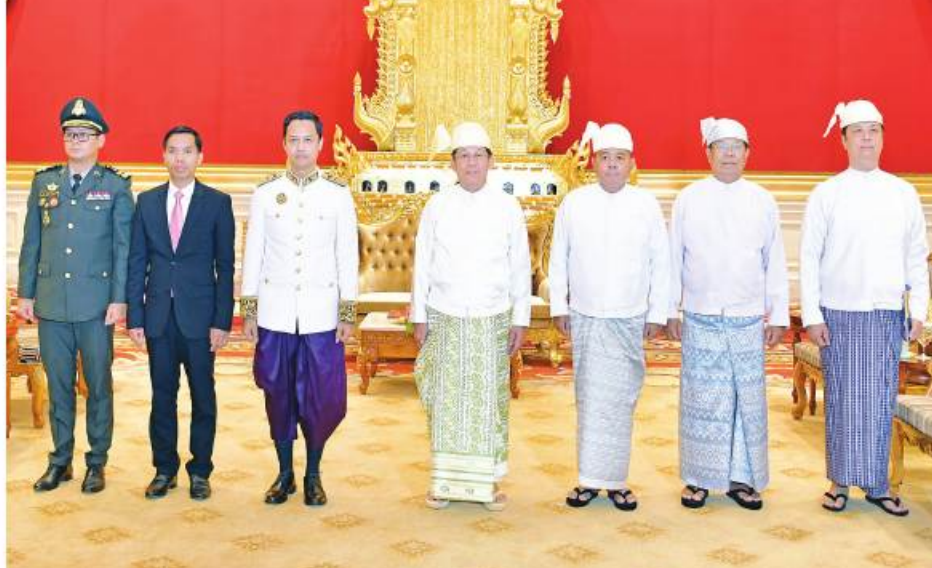
နိုင်ငံတော် စီမံအုပ်ချုပ်ရေး ကောင်စီဥက္ကဋ္ဌ နိုင်ငံတော်ဝန်ကြီးချုပ် ဗိုလ်ချုပ်မှူးကြီး မင်းအောင်လှိုင်နှင့် မြန်မာနိုင်ငံဆိုင်ရာ ကမ္ဘောဒီးယားနိုင်ငံ သံအမတ်ကြီး H.E.Mr. CHUM Angvichet တို့ မှတ်တမ်းတင် စာတံပုံရိုက်စဉ်။

ပူးပေါင်းဆောင်ရွက်မှုများ တိုးမြှင့်ဆောင် ရွက်သွားမည့်ကိစ္စရပ်များ၊ မြန်မာနိုင်ငံတွင် ကိုဗစ်-၁၉ ရောဂါ ဖြစ်ပွားချိန်၌ ကမ္ဘော ဒီးယားနိုင်ငံက အကူအညီများပေးခဲ့မှုနှင့် ကိုဗစ်-၁၉ ကာကွယ်ဆေးများ ထပ်မံပေး အပ်သွားမည့်အခြေအနေ၊ နှစ်နိုင်ငံခရီး သွားလုပ်ငန်းများဖွံ့ဖြိုးတိုးတက်ရေးအတွက် လေကြောင်းတိုက်ရိုက်ပျံသန်းပြေးဆွဲမှုတိုး ချဲ့ရေးကိစ္စရပ်များ၊ သာသနာရေး၊ ပညာ ရေးနှင့်ကုန်သွယ်မှုကဏ္ဍများတွင် ပူးပေါင်း ဆောင်ရွက်မှုများမြှင့်တင်ဆောင်ရွက်သွား မည့်ကိစ္စရပ်များနှင့်ပတ်သက်၍ ရင်းရင်းနှီးနှီး ဆွေးနွေးခဲ့ကြသည်။ တွေ့ဆုံပွဲအပြီးတွင် နိုင်ငံတော်စီမံ အုပ်ချုပ်ရေးကောင်စီဥက္ကဋ္ဌ နိုင်ငံတော် ဝန်ကြီးချုပ်နှင့် မြန်မာနိုင်ငံဆိုင်ရာ ကမ္ဘော ဒီးယားနိုင်ငံသံအမတ်ကြီးတို့သည် မှတ်တမ်း တင်စာတံပုံရိုက်ကြသည်။