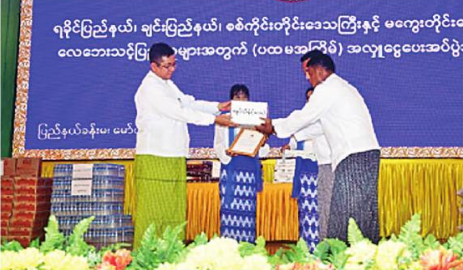
မွန်ပြည်နယ်ဝန်ကြီးချုပ် ဦးအောင်ကြည်သိန်းထံ တိုင်းဒေသကြီးနှင့် ပြည်နယ်များရှိ မုန်တိုင်းဒဏ်သင့်ဒေသများ၌ ကူညီကယ်ဆယ်ရေးနှင့် ပြန်လည်ထူထောင်ရေးလုပ်ငန်းများအတွက် စေတနာရှင်၊ အလှူရှင်များက အလှူငွေများ ပေးအပ်လှူဒါန်းစဉ်

နေပြည်တော် မေ ၁၉ - ဘင်္ဂလားပင်လယ်အော်တွင် ဖြစ်ပေါ်ခဲ့သည့် ဆိုင်ကလုန်းမုန်တိုင်း “မိုခါ” (MOCHA)တိုက်ခတ်မှုကြောင့် မုန်တိုင်းဒဏ်သင့်ဒေသများ၌ ကူညီကယ်ဆယ်ရေးနှင့် ပြန်လည်ထူထောင်ရေးလုပ်ငန်းများ ပေးအပ်လှူဒါန်းခြင်းကို ယနေ့နံနက်ပိုင်းတွင် မော်လမြိုင်မြို့၊ ပြည်နယ်ခန်းမ၌ ပြုလုပ်ရာ မွန်ပြည်နယ်ဝန်ကြီးချုပ် ဦးအောင်ကြည်သိန်း၊ အရှေ့တောင်တိုင်းစစ်ဌာနချုပ် တိုင်းမှူး ဗိုလ်မှူးချုပ်စိုးမင်း၊ ပြည်နယ်ဝန်ကြီးများ၊ ဌာနဆိုင်ရာတာဝန်ရှိ