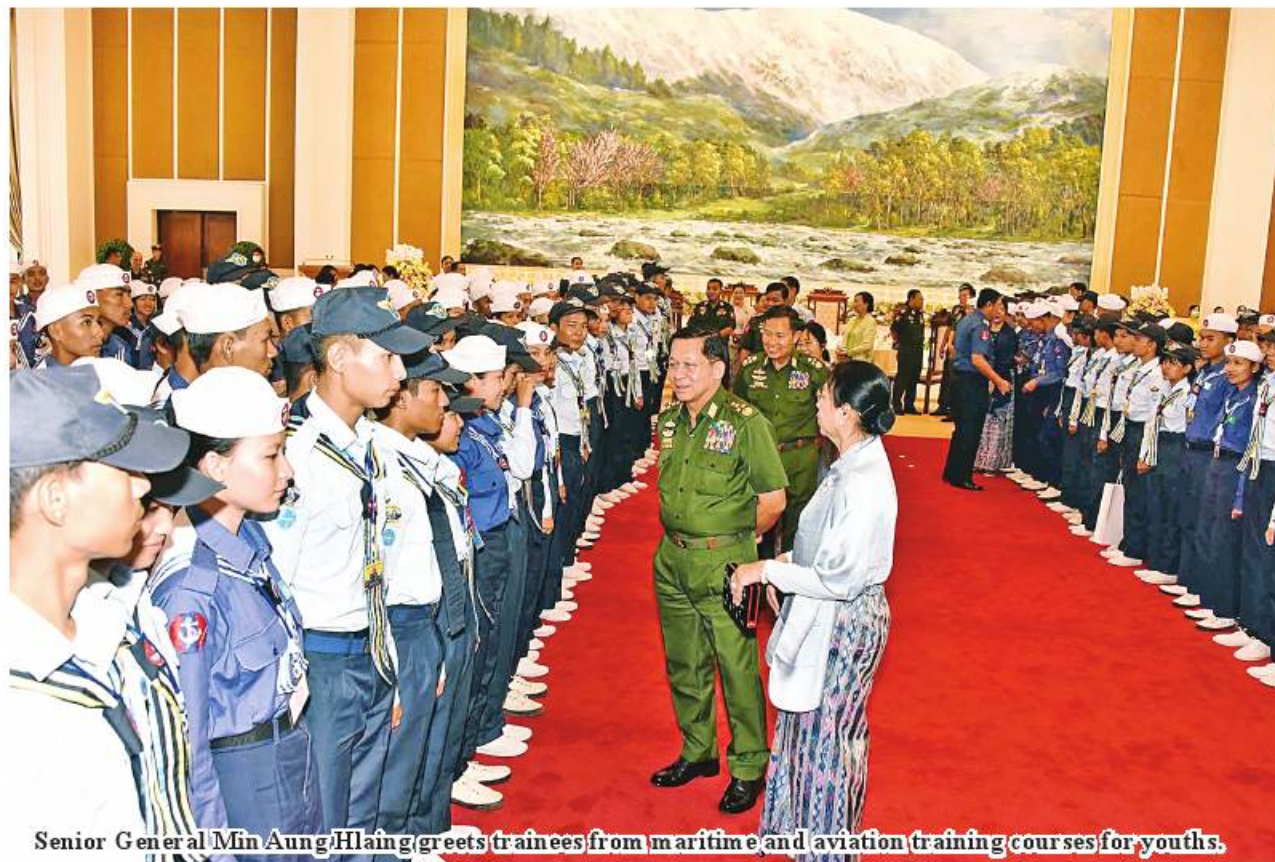
Senior General Min Aung Hlaing greets trainees from maritime and aviation training courses for youths.

“Today’s youths are tomorrow’s adults.” So, all should carry out the nation building task with harmony and unison, based on their childhood friendship.”