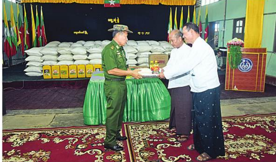
အမျိုးသားသဘာဝဘေးအန္တရာယ်ဆိုင်ရာ စီမံခန့်ခွဲမှုကော်မတီဥက္ကဋ္ဌ နိုင်ငံတော်စီမံအုပ်ချုပ်ရေး ကောင်စီဒုတိယဥက္ကဋ္ဌ ဒုတိယတပ်မတော်ကာကွယ်ရေးဦးစီးချုပ် ကာကွယ်ရေးဦးစီးချုပ်(ကြည်း) ဒုတိယဗိုလ်ချုပ်မှူးကြီးစိုးဝင်း ကျောက်တော်မြို့ရှိ မုန်တိုင်းသင့်ပြည်သူများနှင့် ဌာနဆိုင်ရာဝန်ထမ်းများ အတွက် ဆန်၊ ဆီ၊ ဝဲ၊ ငါးပိ စသည့်အခြေခံစားသောက်ကုန်ပစ္စည်းများနှင့် စားသောက်ဖွယ်ရာများကို ထောက်ပံ့ပေးအပ်စဉ်။

ကျော့မှူးမှအဆက် လုပ်ငန်းများကို ဆောင်ရွက်နေသည်ကို မိမိမြို့ရွာ သန့်ရှင်းသာယာလှပရေးအတွက် ကာကွယ်ရေးဦးစီးချုပ်(ကြည်း)နှင့် အဖွဲ့ဝင် တွေ့ရှိရသည်အတွက် ဝမ်းသာမိပါကြောင်း၊ အင်တိုက်အားတိုက် ဝိုင်းဝန်းစုပေါင်း များသည် ဆိုင်ကလုန်းမုန်တိုင်း(မိုခါ) ကူညီကယ်ဆယ်ရေးအဖွဲ့များ လာရောက် ဆောင်ရွက်ပေးရန်လိုကြောင်း။