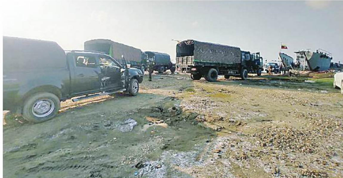
သဘာဝဘေးအန္တရာယ်ကျရောက်သောဒေသများတွင် တပ်မတော်မှ ကူညီကယ်ဆယ်ရေးအဖွဲ့များက ကူညီကယ်ဆယ်ရေးနှင့် ပြန်လည်ထူထောင်ရေးလုပ်ငန်းများ ပူးပေါင်းပါဝင်ဆောင်ရွက်ပေးလျက်ရှိစဉ်။

နေပြည်တော် ၈ ၁၉ သဘာဝဘေးအန္တရာယ် ကျရောက်ခဲ့ရသည့်ဒေသများတွင် လိုအပ်သည့် ကူညီကယ်ဆယ်ရေးနှင့် ပြန်လည်ထူထောင်ရေးလုပ်ငန်းများ ကူညီဆောင်ရွက်ပေးနိုင်ရေးအတွက် တပ်မတော်မှ ကြိုတင်စုဖွဲ့စေလွှတ်ထားသည့် ကူညီကယ်ဆယ်ရေးအဖွဲ့များသည် နယ်မြေခံ လုံခြုံရေးတပ်ဖွဲ့ဝင်များ၊ လူမှုကယ်ဆယ်ရေးအဖွဲ့များနှင့် ပူးပေါင်း၍ အင်တိုက်အားတိုက် ကူညီဆောင်ရွက်ပေးလျက်ရှိသည်။ ထိုသို့ ဆောင်ရွက်ပေးလျက်ရှိရာ ယနေ့တွင်လည်း ကျောက်ဖြူမြို့တွင် အခြေပြုလျက်ရှိသည့် ကူညီကယ်ဆယ်ရေးအဖွဲ့များသည် ကျောက်ဖြူမြို့ ပြင်ပမြို့မော်ရပ်ကွက်ရှိ အခြေခံပညာ မူလတန်းလွန်ကျောင်း၌ သဘာဝဘေးအန္တရာယ်ကြောင့် ထိခိုက်ပျက်စီးခဲ့ရသည်များကို လိုအပ်သည့် ရှင်းလင်းရေးလုပ်ငန်းများ ကူညီဆောင်ရွက်ပေးခြင်း၊ စားသောက်ဖွယ်ရာများ လျှော့ဒါန်းပေးခြင်းများကို ဆောင်ရွက်ပေးလျက်ရှိပြီး ယာဉ်အုပ်စုတွင်ပါဝင်သည့် ဆေးဝန်ထမ်းတပ်ဖွဲ့ဝင်များကလည်း လိုအပ်သည့် ကျန်းမာရေး စောင့်ရှောက်မှုများကို ဆောင်ရွက်ပေးသည်။ ပုဏ္ဏားကျွန်းမြို့တွင် ရောက်ရှိအခြေပြု