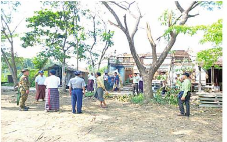
ဖျာပုံမြို့နယ် ကျိုကျိုက်တိုက်နယ်ဆေးရုံ ကျိုကျိုက်တိုက်ကျေးရွာရှိ လေဘေးသင့်ပြည်သူများကို ကူညီစောင့်ရှောက်မှုလုပ်ငန်းများ ဆောင်ရွက်ပေးစဉ်

နေပြည်တော် မေ ၁၉ - အနောက်တောင်တိုင်း စစ်ဌာနချုပ်မှ သဘာဝလေဘေး တိုက်ခတ်မှုကြောင့် ရောဂါတိုင်းဒေသကြီး ဖျာပုံမြို့နယ် ကျိုကျိုက်တိုက်ကျေးရွာရှိ ကျိုကျိုက်တိုက်နယ်ဆေးရုံ၊ အခြေခံပညာအထက်တန်းကျောင်းနှင့် မရဲ့ပျားမွတ်ကျေးရွာရှိ လူနေအိမ်များ ပြိုကျပျက်စီးမှုများကြောင့် လေဘေးသင့်ပြည်သူများအား ထောက်ပံ့ငွေများပေးအပ်ခြင်းကို ယနေ့နေ့လယ်ပိုင်းတွင်ပြုလုပ်ရာ