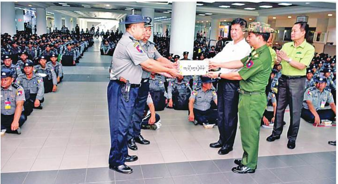
မန္တလေးတိုင်းဒေသကြီးဝန်ကြီးချုပ် ဦးမျိုးအောင်နှင့် အလယ်ပိုင်းတိုင်းစစ်ဌာနချုပ် တိုင်းမှူး ဗိုလ်ချုပ်ကျော်စွာတို့က စစ်ကိုင်းမြို့ရှိ မြန်မာနိုင်ငံရဲတပ်ဖွဲ့လေ့ကျင့်ရေးသင်တန်းကျောင်းမှ မြန်မာနိုင်ငံရဲတပ်ဖွဲ့ဝင်များကို ဂုဏ်ပြုအပ်နှံခြင်းပေးအပ်စဉ်။ တိုက်ခတ်မှုများကြောင့် ထိခိုက်ပျက်စီးမှုများကြုံရသည့် ဒေသများသို့ ထောက်ပံ့ပေးအပ်ခဲ့သည်။ ဆက်လက်၍ လည်း အဆိုပါလေ့ကျင့်ရေးသင်တန်းကျောင်းမှ မြန်မာနိုင်ငံရဲတပ်ဖွဲ့ဝင်စုစုပေါင်း ဦးရေ ၆၀၀ ထိ ဆက်လက်ပို့ဆောင်ပေးသွားမည်ဖြစ်ကြောင်း သိရသည်။ အဆိုပါ တပ်မတော်(လေ)မှ ထောက်ပံ့ပေးအပ်ခဲ့သည့် ပစ္စည်းများကို တာဝန်ရှိသူများက လက်ခံယူဆောင်သွားကြောင်း သိရသည်။ ဆက်လက်၍ ထောက်ပံ့ပေးအပ်ခဲ့သည့် ပစ္စည်းများကို တာဝန်ရှိသူများက လက်ခံယူဆောင်သွားမည်ဖြစ်ကြောင်း သတင်းရရှိသည်။

၂၅ ဦးနှင့် အိန္ဒိယနိုင်ငံက လျှင်စွာပို့ဆောင်ပေးခဲ့သည်။ ဘီစကွတ်မုန်တိုင်း ၅၀၀၊ ဆိုလာ ၁၉ ဖာ၊ ဆေးပစ္စည်း ၉၇ ဖာ၊ ခေါက်ဆွဲခြောက် ၅၀၀၊ ခေါက်ဆွဲ ၁၅၅၄ တွဲ၊ မုန့်ဖျိုးစုံ ၁၀၀၀၊ ဝက်သေတ္တာ ၁၀၀၀၊ ဆန်ပြုတ် ၁၀ ဖာ၊ ဓာတ်ဆား ရှစ်အိတ်၊ သွပ်ပြား ၂၆၇ ချပ်၊ စက္ကူဖာ သုံးဖာ၊ အရေးပေးပစ္စည်းများနှင့် ကူညီကယ်ဆယ်ရေးပစ္စည်းများကို တင်ဆောင်၍ ရန်ကင်းမြို့ရှိ မင်္ဂလာဒုံလေဆိပ်မှ စစ်တွေလေဆိပ်သို့ တပ်မတော်(လေ)မှ လေယာဉ်များဖြင့် တိုက်ခတ်ပို့ဆောင်ပေးခဲ့သည်။ ထို့အတူ စစ်ကိုင်းတိုင်းဒေသကြီး စစ်ကိုင်းမြို့ရှိ မြန်မာနိုင်ငံရဲတပ်ဖွဲ့လေ့ကျင့်ရေးသင်တန်းကျောင်းမှ မြန်မာနိုင်ငံရဲတပ်ဖွဲ့ဝင် ၃၅၈ ဦးကို ကူညီကယ်ဆယ်ရေးလုပ်ငန်းများ ဆောင်ရွက်ရန်အတွက် တာဝန်ပေးလှူဒါန်းမှု စစ်တွေလေဆိပ်သို့ ယနေ့တွင် တပ်မတော်(လေ)မှ လေယာဉ်ဖြင့် ငါးကြိမ်ပို့ဆောင်ပေးခဲ့သည်။ အဆိုပါကူညီကယ်ဆယ်ရေးအဖွဲ့များကို မန္တလေးတိုင်းဒေသကြီး ဝန်ကြီးချုပ် ဦးမျိုးအောင်အလယ်ပိုင်းတိုင်းစစ်ဌာနချုပ် တိုင်းမှူး ဗိုလ်ချုပ်