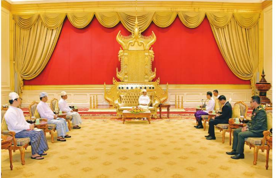
နိုင်ငံတော်စီမံအုပ်ချုပ်ရေးကောင်စီဥက္ကဋ္ဌ နိုင်ငံတော်ဝန်ကြီးချုပ် ဗိုလ်ချုပ်မှူးကြီးမင်းအောင်လှိုင်ထံ မြန်မာနိုင်ငံဆိုင်ရာ ကမ္ဘောဒီးယားနိုင်ငံ သံအမတ်ကြီး H.E.Mr. CHUM Angvichet က ၎င်း၏ သံအမတ်ခန့်အပ်လွှာကို ပေးအပ်စဉ်။