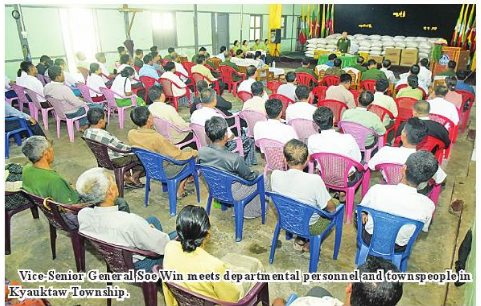
Vice-Senior General Soe Win meets departmental personnel and townspeople in Kyauktaw Township.

village with a strong sense of self-reliance. The people and department concerned also should participate in the rehabilitation processes of rescue teams. The universities and basic education schools will be opened on 1 June and