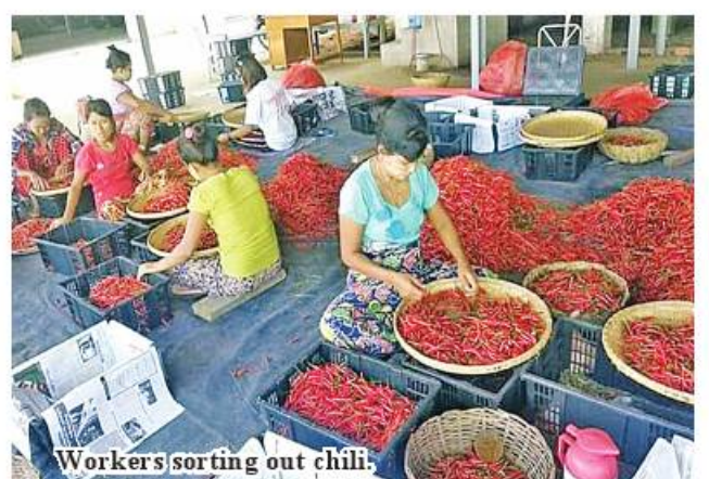
Workers sorting out chilli.

Ngaphe, Thazi, Kyaukse, Kume, Myittha, Hanmyintmo, Yamethin and Monywa. At present, chilli from Ayeyawady Region and Kyaukse get good prices in Myawady market. Remaining chilli will be sent to China and Myawady under the arrangement of local merchants and associations.