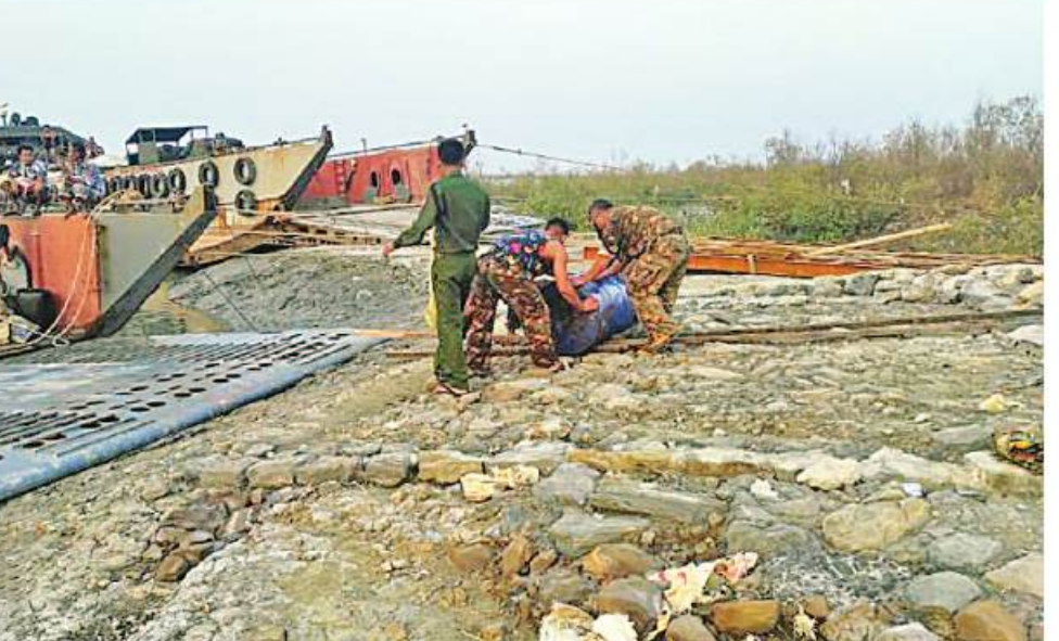
ရခိုင်ပြည်နယ်အတွင်းရှိ မုန်တိုင်းဒဏ်သင့်ပြည်သူများအတွက် ကူညီကယ်ဆယ်ရေးအဖွဲ့ဝင်များနှင့် ထောက်ပံ့ရေးပစ္စည်းများကို တပ်မတော်(ရေ)မှ တပ်ဖွဲ့တင်ရေယာဉ်(ချင်းတွင်း)ဖြင့် ပို့ဆောင်ပေးစဉ်။

နေပြည်တော် မေ ၁၉ - အလွန်အလွန်အားကောင်းသော ဆိုင်ကလန်းမုန်တိုင်း “မိုခါ” (MOCHA) ဖြတ်သန်းတိုက်ခတ်မှုကြောင့် ထိခိုက်ပျက်စီးဆုံးရှုံးမှုများဖြစ်ပေါ်ခဲ့သော ရခိုင်ပြည်နယ်စစ်တွေမြို့ရှိ မုန်တိုင်းဒဏ်သင့်ပြည်သူများကို လိုအပ်သည့် သဘာဝဘေးအန္တရာယ်ကူညီကယ်ဆယ်ရေးလုပ်ငန်းများ ဆောင်ရွက်ရန်အတွက် တပ်မတော်(ရေ)မှ တပ်ဖွဲ့တင်ရေယာဉ်(ချင်းတွင်း)သည် မြန်မာနိုင်ငံရဲတပ်ဖွဲ့ဝင် ၆၈၅ ဦးနှင့် စစ်အင်ဂျင်နီယာ ညွှန်ကြားရေးမှူးရုံးမှ အရပ်သားဝန်ထမ်း ၁၀၇ ဦးတို့ကိုလည်းကောင်း၊ ကယ်ဆယ်ရေးသုံးပစ္စည်းများ၊ ရိက္ခာအမည်စုံ၊ အထောက်အကူပြုပစ္စည်းများ၊ ဆန်အိတ် ၂၀၀ နှင့် ဆောက်လုပ်ရေးသုံးပစ္စည်းများ စုစုပေါင်း ၂၅ တန်ခန့်တို့ကိုလည်းကောင်း တင်ဆောင်၍ ယနေ့နေ့လယ်ပိုင်းတွင် ရန်ကုန်-စစ်တွေ ခရီးစဉ်အတိုင်း ထွက်ခွာသွားကြသည်။ အဆိုပါ ကယ်ဆယ်ရေးတပ်ဖွဲ့ဝင်များကို ရန်ကုန်တိုင်းဒေသကြီးဝန်ကြီးချုပ် ဦးစိုးသိန်း၊ ရန်ကုန်တိုင်းစစ်ဌာနချုပ် ဒုတိယတိုင်းမှူး ဗိုလ်မှူးချုပ်ဝင်းမြင့်ခိုင်နှင့် တာဝန်ရှိသူများက လာရောက်ပို့ဆောင် နှုတ်ဆက်ကြသည်။ ထို့နောက် တိုင်းဒေသကြီးဝန်ကြီးချုပ်က တပ်ဖွဲ့ဝင်များအား အမှာစကားပြောကြားပြီး ရန်ကုန်တိုင်းဒေသကြီးအစိုးရအဖွဲ့က ထောက်ပံ့သည့် ထောက်ပံ့ငွေကျပ်သိန်းတစ်ရာနှင့် ရေသန့်ဘူး ၂၀၀ တို့ကို တိုင်းဒေသကြီးဝန်ကြီးချုပ်က ပေးအပ်ရာ တာဝန်ရှိသူတစ်ဦးက လက်ခံရယူခဲ့ကြောင်း သတင်းရရှိသည်။