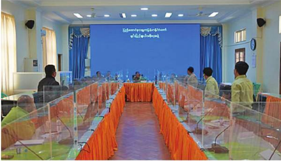
ဆိုင်ကလုန်း မုန်တိုင်း (မိုခါ)တိုက်ခတ်မှုကြောင့် ချင်းပြည်နယ်အတွင်း ထိခိုက်ပျက်စီးမှုများကို ပြန်လည်ထူထောင်ရေးလုပ်ငန်းများ ဆောင်ရွက်နိုင်ရေး အစည်းအဝေးပြုလုပ်စဉ်

နေပြည်တော် မေ ၁၉ - ကာကွယ်ရေးဝန်ကြီးဌာနမှ ဒုတိယဦးစွာ ဒုတိယဗိုလ်ချုပ်ကြီးမင်းနိုင်က ဆိုင်ကလုန်းမုန်တိုင်း(မိုခါ) တိုက်ခတ်မှုကြောင့် ချင်းပြည်နယ်အတွင်း ထိခိုက်ပျက်စီးမှုများအား ကူညီကယ်ဆယ်ရေးနှင့် ပြန်လည်ထူထောင်ရေးလုပ်ငန်း ဆောင်ရွက်နိုင်ရေး အစည်းအဝေးကို ယနေ့တွင် ချင်းပြည်နယ် ဟားခါးမြို့၊ ပြည်နယ်အစိုးရအဖွဲ့ရုံး အစည်းအဝေးခန်းမ၌ပြုလုပ်ရာ