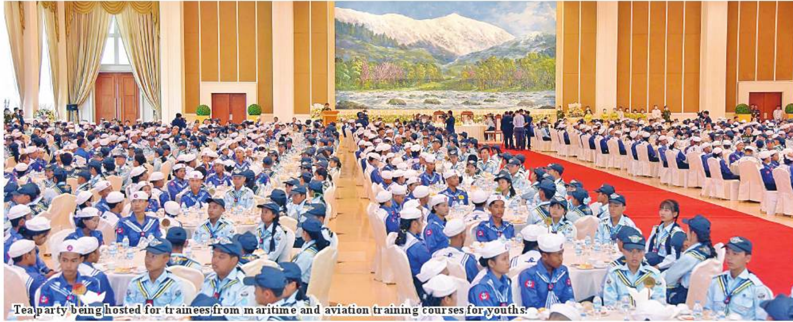
Tea party being hosted for trainees from maritime and aviation training courses for youths.