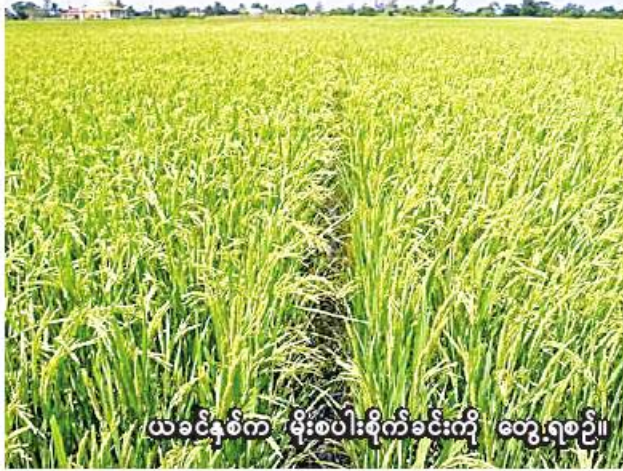
ယခင်နှစ်က မိုးစပါးစိုက်ခင်းကို တွေ့ရစဉ်။

ယခုနှစ် ကလေးခရိုင်တွင် မိုး စပါးစိုက်ပျိုးမည့် တောင်သူများ အတွက် သက်ဆိုင်ရာမြို့နယ် စိုက် ပျိုးရေးဦးစီးဌာနက မျိုးကောင်း မျိုးသန့်များ စိုက်ပျိုးရန်အတွက် ပညာပေးခြင်း၊ သဘာဝမြေဩဇာ ပြုလုပ်သုံးစွဲနည်းပညာများ၊ မိုး သီးနှံများ အချိန်မီစိုက်ပျိုးနိုင်ရန်၊ စီးပွားဖြစ်မျိုးများ စိုက်ပျိုးနိုင်ရန် အတွက် နည်းပညာပေးလုပ်ငန်းများ ဆောင်ရွက်ပေးလျက်ရှိ ကြောင်း သိရသည်။ ကလေးခရိုင်တွင် နွေသီးနှံစိုက် ပျိုးရာသီက နွေစပါး ၃၉၂၄ ဧက စိုက်ပျိုးရန် လျာထားပြီး ယခုနှစ် ဇန်နဝါရီလမှစတင်၍ ဧပြီလထိ စိုက်ပျိုးခဲ့ရာ နွေစပါးသီးနှံ ၃၈၅၇ ဧကတို့ စိုက်ပျိုးနိုင်ခဲ့ကြောင်း သိရသည်။ (၂၀၆)