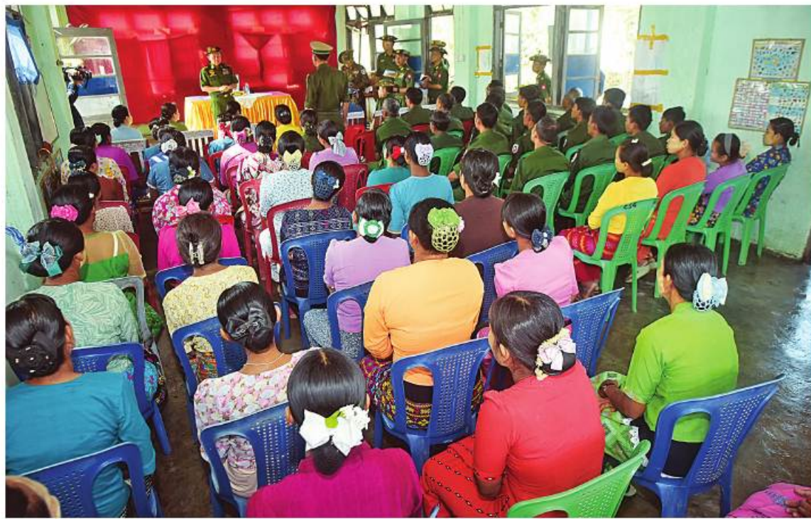
အမျိုးသားသဘာဝဘေးအန္တရာယ်ဆိုင်ရာစီမံခန့်ခွဲမှုကော်မတီဥက္ကဋ္ဌ နိုင်ငံတော်စီမံအုပ်ချုပ်ရေးကောင်စီဒုတိယဥက္ကဋ္ဌ ဒုတိယ တပ်မတော်ကာကွယ်ရေးဦးစီးချုပ် ကာကွယ်ရေးဦးစီးချုပ်(ကြည်း) ဒုတိယဗိုလ်ချုပ်မှူးကြီးစိုးဝင်း ကျောက်တော်တပ်နယ်ရှိ သဘာဝဘေးအန္တရာယ်သင့်ခဲ့သည့် အရာရှိ၊ စစ်သည်၊ မိသားစုဝင်များကို တွေ့ဆုံအားပေးစကားပြောကြားစဉ်။

ကျော့မှူးမှအဆက် လုပ်ငန်းများကို ဆောင်ရွက်နေသည်ကို မိမိမြို့ရွာ သန့်ရှင်းသာယာလှပရေးအတွက် ကာကွယ်ရေးဦးစီးချုပ်(ကြည်း)နှင့် အဖွဲ့ဝင် တွေ့ရှိရသည်အတွက် ဝမ်းသာမိပါကြောင်း၊ အင်တိုက်အားတိုက် ဝိုင်းဝန်းစုပေါင်း များသည် ဆိုင်ကလုန်းမုန်တိုင်း(မိုခါ) ကူညီကယ်ဆယ်ရေးအဖွဲ့များ လာရောက် ဆောင်ရွက်ပေးရန်လိုကြောင်း။