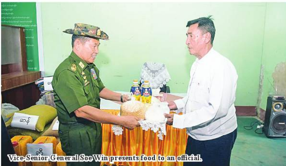
Vice-Senior General Soe Win presents food to an official.

mental officials and town elders reported on the damage and losses of houses, buildings, schools, hospitals and departmental buildings in the storm and other requirements. The Vice-Senior General attended to the needs and provided basic foodstuffs such as rice, cooking oil, beans and fish paste to the victims of Mocha and departmental staff. The Vice-Senior General and party also provided cash assistance to the members of the Bago Region Fire Brigade who served rescue and relief measures in Rathedaung. Moreover, the Vice-Senior General and party went to Kyauktaw and Rathedaung