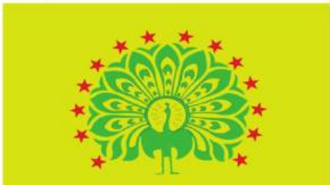
ဒီမိုကရက်တစ်ပါတီ၏ တံဆိပ်ပုံစံ