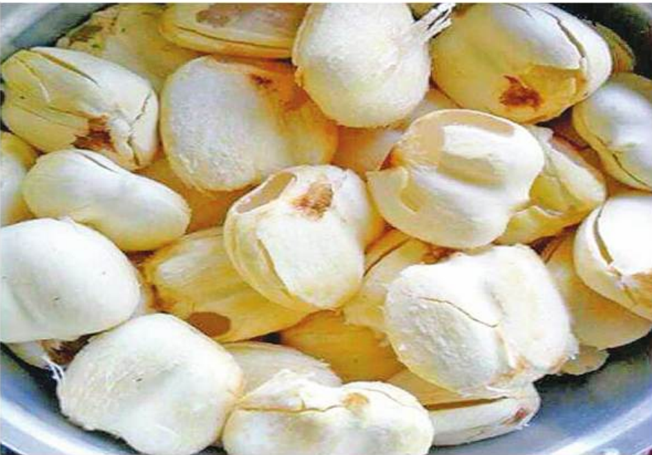
ဆေးဖက်ဝင် ထန်းသီးဆန်ကို တွေ့ရစဉ်။

မေး ။ ။ ဆရာကြီးစင်ဗျာ ကျွန်တော်အသက် ၅၀ ကျော်ပါပြီ။ အများအားဖြင့် ကျန်းမာ ပါတယ်။ အစုရက်ပိုင်းအတွင်းမှာရာသီ ဥတုပူလို့ ရေအေးအတော်သောက်ဖြစ်ပါ တယ်။ ရေစေ့သေတ္တာထဲမှာထည့်ထားတဲ့ သောက်ရေသန့်အေးအေးအေးအေးကို တော်