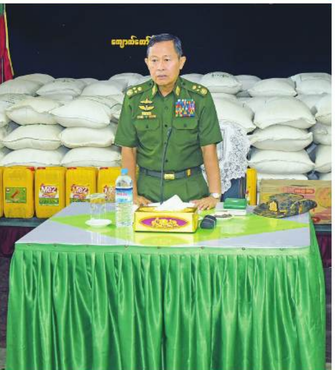
အမျိုးသားသဘာဝဘေးအန္တရာယ်ဆိုင်ရာစီမံခန့်ခွဲမှုကော်မတီဥက္ကဋ္ဌ နိုင်ငံတော်စီမံအုပ်ချုပ်ရေးကောင်စီဒုတိယဥက္ကဋ္ဌ ဒုတိယတပ်မတော်ကာကွယ်ရေးဦးစီးချုပ် ကာကွယ်ရေးဦးစီးချုပ်(ကြည်း) ဒုတိယဗိုလ်ချုပ်မှူးကြီးစိုးဝင်း၊ ကျောက်တော်မြို့ရှိ မုန်တိုင်းသင့်ဒေသခံတိုင်းရင်းသားပြည်သူများနှင့် ဌာနဆိုင်ရာဝန်ထမ်းများကို တွေ့ဆုံအားပေးစကားပြောကြားစဉ်။

နေပြည်တော် မေ ၁၉ ရခိုင်ပြည်နယ် စစ်တွေမြို့သို့ရောက်ရှိနေသော အမျိုးသားသဘာဝဘေးအန္တရာယ်ဆိုင်ရာစီမံခန့်ခွဲမှုကော်မတီဥက္ကဋ္ဌ နိုင်ငံတော်စီမံအုပ်ချုပ်ရေးကောင်စီဒုတိယဥက္ကဋ္ဌ ဒုတိယတပ်မတော်ကာကွယ်ရေးဦးစီးချုပ် ကာကွယ်ရေးဦးစီးချုပ်(ကြည်း) ဒုတိယဗိုလ်ချုပ်မှူးကြီးစိုးဝင်းသည် ဇနီး ဒေါ်သန်းသန်းနွယ်၊ ပြည်ထောင်စုဝန်ကြီးများ၊ ပြည်နယ်ဝန်ကြီးချုပ်၊ ကာကွယ်ရေးဦးစီးချုပ်မှူး တပ်မတော်အရာရှိကြီးများ၊ အနောက်ပိုင်းတိုင်းစစ်ဌာနချုပ်တိုင်းမှူးနှင့်တာဝန်ရှိသူများလိုက်ပါ၍ ယနေ့နံနက်ပိုင်းတွင် ဆိုင်ကလုန်းမုန်တိုင်း(မိုခါ) ကျရောက်မှုကြောင့် ပျက်စီးဆုံးရှုံးမှုများဖြစ်ပေါ်ခဲ့သည့်ကျောက်တော်မြို့နှင့်ရသေ့တောင်မြို့တို့သို့ သွားရောက်ကြည့်ရှုပြီး ဒေသခံတိုင်းရင်းသားပြည်သူများ၊ ဌာနဆိုင်ရာများ၊ တပ်မတော်သားများနှင့်မိသားစုဝင်များကို သီးခြားစီ တွေ့ဆုံအားပေးစကားပြောကြားသည်။ ဦးစွာ နိုင်ငံတော်စီမံအုပ်ချုပ်ရေးကောင်စီ ဒုတိယဥက္ကဋ္ဌ ဒုတိယတပ်မတော်ကာကွယ်ရေးဦးစီးချုပ် စာမျက်နှာ ၂၀ ကော်လံ ၁ ☆