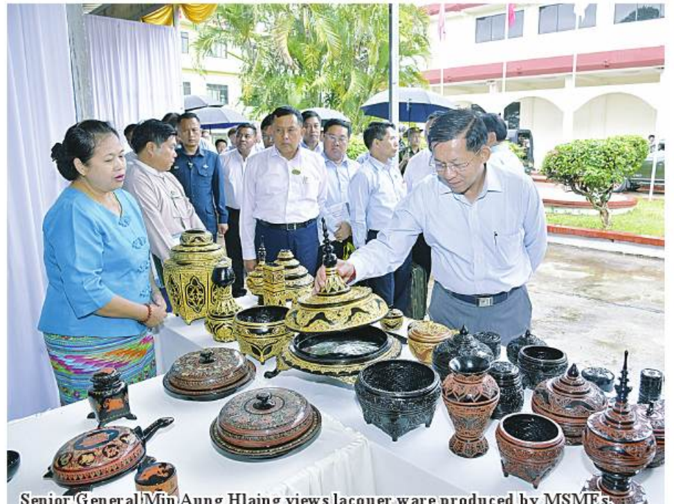
Senior General Min Aung Hlaing views lacquer ware produced by MSMEs.

and enhance socioeconomic life of rural people, assistance of machines and capital,