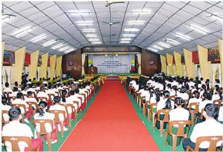
မြောက်ပိုင်းတိုင်းစစ်ဌာနချုပ်၌ နွေရာသီသင်တန်းဆင်းပွဲကျင်းပစဉ်။

နေပြည်တော် မေ ၁၂ နွေရာသီ ကျောင်းပိတ်ရက်ကာလများတွင် အားလပ်ချိန်များကို အကျိုးမဲ့မဖြစ်စေဘဲ ကျန်းမာသန်စွမ်းပြီး နိုင်ငံတော်ကို