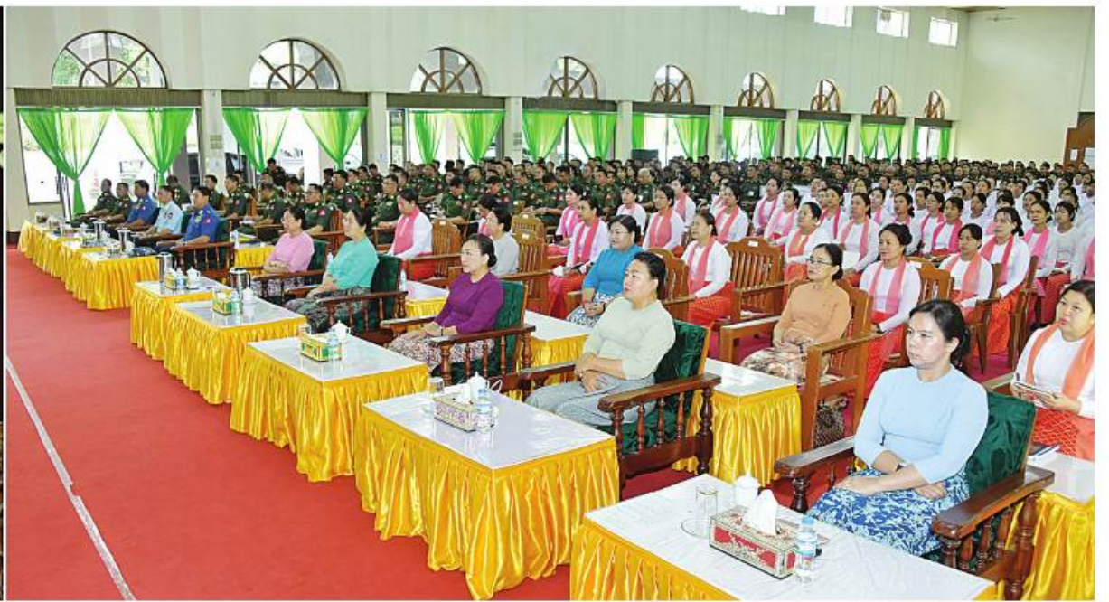
နိုင်ငံတော်စီမံအုပ်ချုပ်ရေးကောင်စီဥက္ကဋ္ဌ တပ်မတော်ကာကွယ်ရေးဦးစီးချုပ် ဗိုလ်ချုပ်မှူးကြီးမင်းအောင်လှိုင် ကြိုက်ဒေသတိုင်းစစ်ဌာနချုပ် ကျိုင်းတုံတပ်နယ်မှ အရာရှိ၊ စစ်သည်၊ မိသားစုများအား တွေ့ဆုံအမှာစကား ပြောကြားစဉ်။