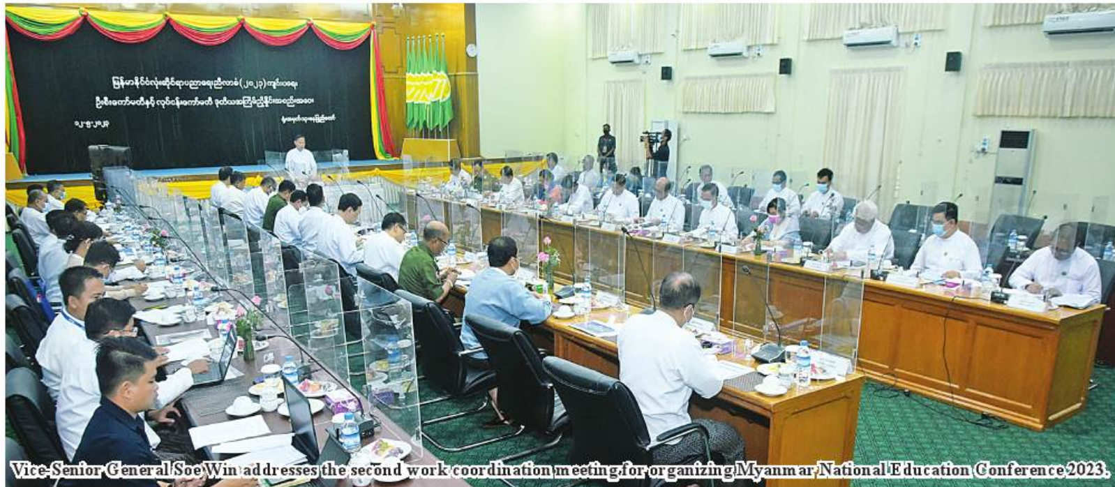
Vice-Senior General Soe Win addresses the second work coordination meeting for organizing Myanmar National Education Conference 2023.

Nay Pyi Taw May 12 The second coordination meeting between the Steering Committee for Holding Myanmar National Education Conference 2023 and the Working Committee was held at the Ministry of Education in Nay Pyi Taw this afternoon. Chairman of the Steering Committee Vice Chairman of State Administration Council Deputy Prime Minister Vice-Senior General Soe Win attended and addressed it.