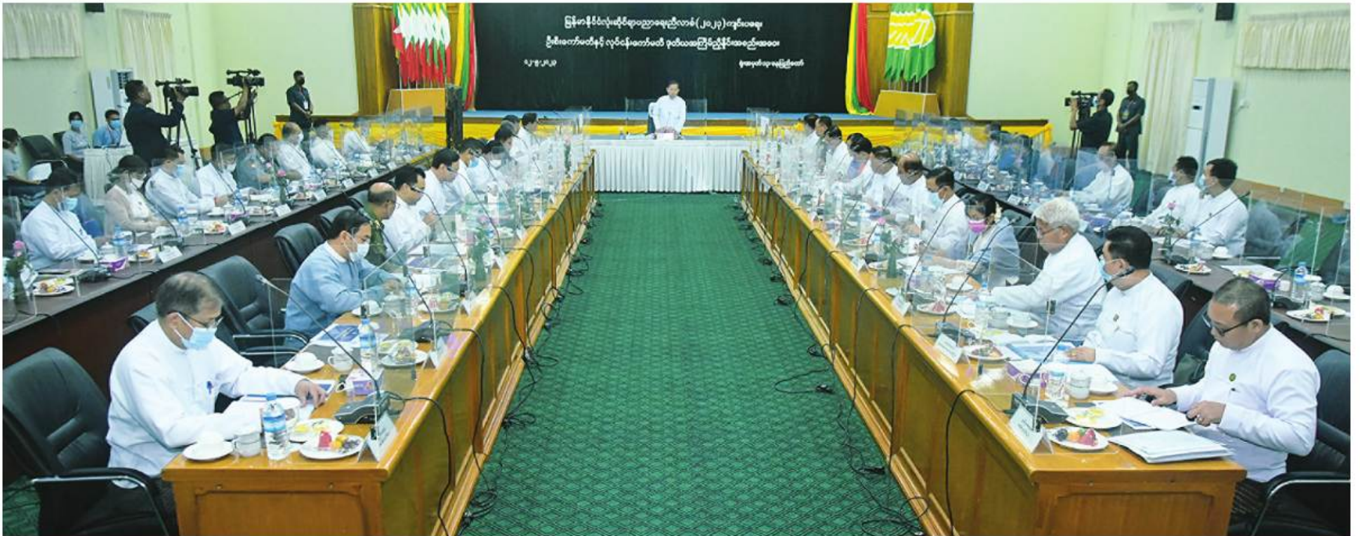
မြန်မာနိုင်ငံလုံးဆိုင်ရာ ပညာရေးညီလာခံ(၂၀၂၃) ကျင်းပရေးဦးစီးကော်မတီဥက္ကဋ္ဌ နိုင်ငံတော်စီမံအုပ်ချုပ်ရေးကောင်စီဒုတိယဥက္ကဋ္ဌ ဒုတိယဝန်ကြီးချုပ် ဒုတိယပိုလ်ချုပ်မှူးကြီးစိုးဝင်း မြန်မာနိုင်ငံလုံးဆိုင်ရာ ပညာရေးညီလာခံ (၂၀၂၃) ကျင်းပရေးဦးစီးကော်မတီနှင့် လုပ်ငန်းကော်မတီ ဒုတိယအကြိမ်ညှိနှိုင်းအစည်းအဝေးတွင် အမှာစကားပြောကြားစဉ်။

နေပြည်တော် မေ ၁၂ မြန်မာနိုင်ငံလုံးဆိုင်ရာ ပညာရေး ညီလာခံ(၂၀၂၃)ကျင်းပရေးဦးစီးကော်မတီ နှင့်လုပ်ငန်းကော်မတီဒုတိယအကြိမ်ညှိနှိုင်း အစည်းအဝေးကို ယနေ့မနက် ၂ နာရီတွင် နေပြည်တော်ရှိ ပညာရေးဝန်ကြီးဌာန အစည်းအဝေးခန်းမ၌ကျင်းပရာ မြန်မာနိုင်ငံ လုံးဆိုင်ရာ ပညာရေးညီလာခံ(၂၀၂၃) ကျင်းပရေးဦးစီးကော်မတီဥက္ကဋ္ဌနိုင်ငံတော် စီမံအုပ်ချုပ်ရေးကောင်စီ ဒုတိယဥက္ကဋ္ဌ ဒုတိယဝန်ကြီးချုပ် ဒုတိယပိုလ်ချုပ်မှူးကြီး စိုးဝင်း တက်ရောက်အမှာစကားပြောကြား သည်။ အစည်းအဝေးသို့ ပြည်ထောင်စုဝန်ကြီး များဖြစ်ကြသည့် ဒေါက်တာညွန့်ဖေနှင့် ဒေါက်တာသက်ခိုင်ဝင်း၊ နေပြည်တော် ကောင်စီဥက္ကဋ္ဌဒုတိယဝန်ကြီးများ၊နေပြည် တော်ကောင်စီဝင်၊ ဒုတိယစာရင်းစစ်ချုပ်၊ အမြဲတမ်းအတွင်းဝန်များ၊ ညွှန်ကြားရေးမှူး ချုပ်များနှင့် တာဝန်ရှိသူများ တက်ရောက် ကြသည်။ အစည်းအဝေးတွင် နိုင်ငံတော်စီမံ အုပ်ချုပ်ရေးကောင်စီဒုတိယဥက္ကဋ္ဌ ဒုတိယ ဝန်ကြီးချုပ်က အမှာစကားပြောကြားရာ တွင် ယနေ့ကျင်းပမည့် မြန်မာနိုင်ငံလုံး ဆိုင်ရာ ပညာရေးညီလာခံ(၂၀၂၃) ကျင်းပ ရေးဦးစီးကော်မတီနှင့် လုပ်ငန်းကော်မတီ