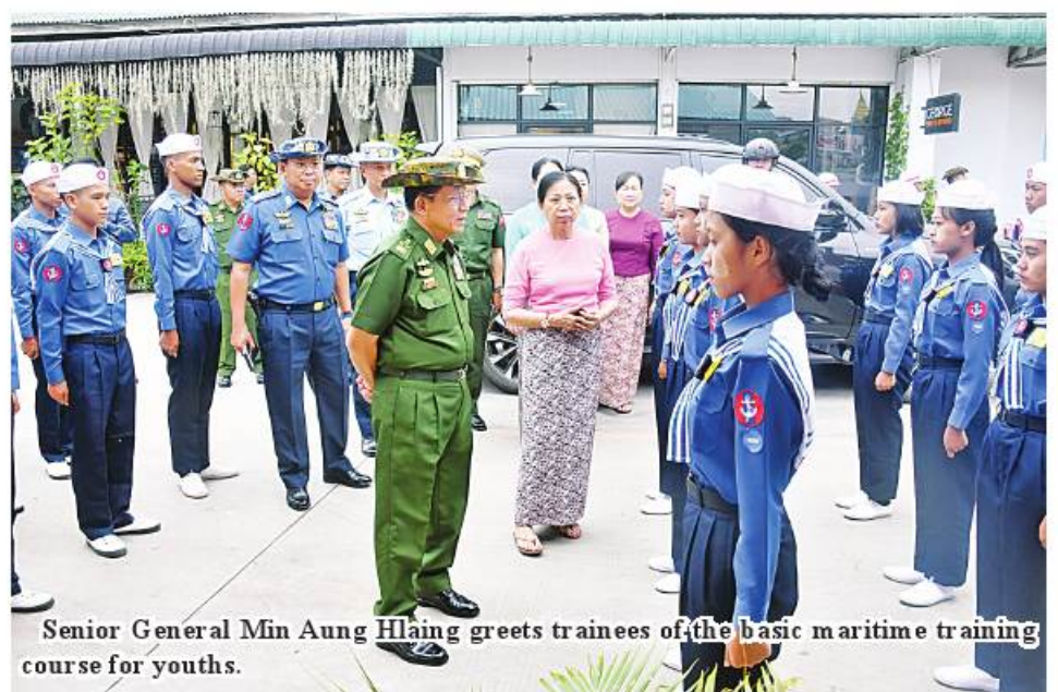
Senior General Min Aung Hlaing greets trainees of the basic maritime training course for youths.

parliament and take over the State power by force. Hence, Tatmadaw has to assume the State duties in accord with the Constitution. According to its roadmap, SAC will hold an election and transfer power to the winning party. Tatmadaw must conduct counterterrorism campaigns