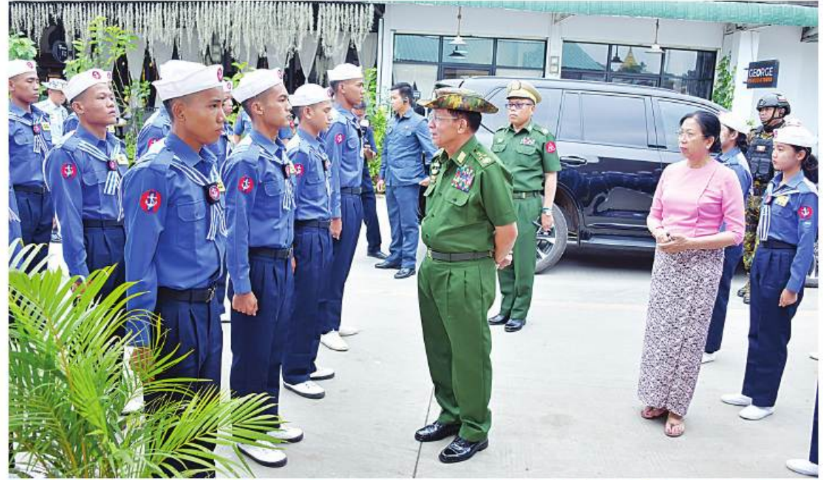
နိုင်ငံတော်စီမံအုပ်ချုပ်ရေးကောင်စီဥက္ကဋ္ဌ တပ်မတော်ကာကွယ်ရေးဦးစီးချုပ် ဗိုလ်ချုပ်မှူးကြီးမင်းအောင်လှိုင်နှင့် ခနီးဒေါ်ကြူကြူလှတို့ တပ်မတော်(ရေ) ရေကြောင်းလူငယ်အခြေခံသင်တန်း ကျွင်းတုံ့စခန်းမှ သင်တန်းသား၊ သင်တန်းသူများအား တစ်ဦးချင်းရင်းရင်းနှီးနှီးနှုတ်ဆက်စဉ်။

ကျန်းမာရေးနှင့်ပတ်သက်၍ မိမိတို့ နိုင်ငံတွင် ကိုဗစ်-၁၉ ရောဂါ ဖြစ်ပွားမှုနှင့် ပတ်သက်၍ ထိန်းသိမ်းနိုင်ခဲ့ကြောင်း၊ လက်ရှိ အချိန်တွင် တစ်ကျော့ပြန်ဖြစ်ပွားလျက်ရှိသဖြင့် သွားလာနေထိုင်မှုများကို ဝရုဖြူနေထိုင်ကြရန်နှင့် ကျန်းမာရေးနှင့်ညီညွတ်သည့် နေထိုင်စားသောက်မှုများကို ဆောင်ရွက်ရန်လိုကြောင်း၊ ကျန်းမာရေးနှင့်ပတ်သက်၍ တစ်ဦးချင်းစီအလိုက်ညီညွတ်မှုတစ်ခုခု နေထိုင်စားသောက်မှုပုံစံရှိရမည်ဖြစ်ကြောင်း၊ တပ်မတော်မှထုတ်ပေးထားသည့် အာဟာရပြည့်ဝသည့်အစားအသောက်များကို ပြည့်ဝစွာစားသုံးရန်လိုကြောင်း၊ အသောက်အစားအပျော်အပါးများကိုလည်း အသိတရားဖြင့် ထိန်းသိမ်းနေထိုင်ခြင်းဖြင့် ကျန်းမာကြံ့ခိုင်သူများ ဖြစ်လာမည်ဖြစ်ကြောင်း၊ သို့မှသာ နိုင်ငံတော် ကာကွယ်ရေးတာဝန်များကို ပြည့်ဝစွာ ထမ်းဆောင်နိုင်မည်ဖြစ်ကြောင်း၊ တစ်ဦးချင်းစီအလိုက် အသိတရား၊ သတိတရားများဖြင့် နေထိုင်လုပ်ကိုင်ဆောင်ရွက်ကြရန်လိုကြောင်းဖြင့် မှာကြားသည်။ ထို့နောက် နိုင်ငံတော်စီမံအုပ်ချုပ်ရေးကောင်စီဥက္ကဋ္ဌ တပ်မတော်ကာကွယ်ရေးဦးစီးချုပ်က ကျွင်းတုံ့တပ်နယ်မှ အရာရှိ၊ စစ်သည်၊ မိသားစုများအတွက် စားသောက်