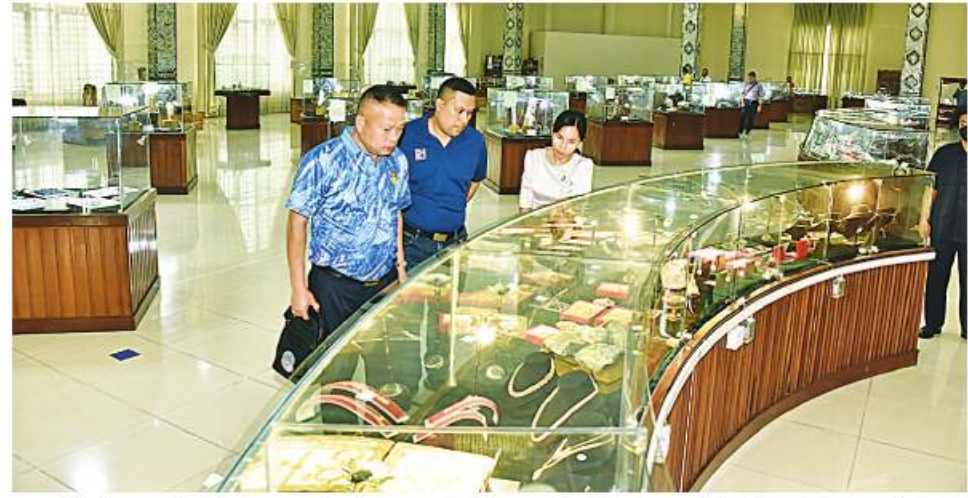
ထိုင်းဘုရင့် လေတပ်မှ ဒုတိယဗိုလ်ချုပ်ကြီး Air Marshal Chainat Phonkit ဦးဆောင်သော ကိုယ်စားလှယ်အဖွဲ့ နေပြည်တော်ရှိ ကျောက်မျက်ရတနာပြတိုက် အတွင်း ကြည့်ရှုလေ့လာစဉ်။

ကျောက်မျက်ရတနာပြတိုက်သို့ သွားရောက် လေ့လာခဲ့ကြပြီး ဂုဏ်ပြုညစာစားပွဲသို့ တက်ရောက်ကြသည်။ ဆက်လက်၍ Air Marshal Chainat Phonkit ဦးဆောင်သော ကိုယ်စားလှယ်အဖွဲ့သည် မေ ၁၀ ရက် နံနက်ပိုင်းတွင် နေပြည်တော်ရှိ ဥပုတသန္တိစေတီတော်သို့ သွားရောက်ဖူးမြော်ခြင်းနှင့် ဆင်ဖြူတော်အား ကြည့်ရှုလေ့လာခဲ့ကြသည်။ ထို့နောက် Air Marshal Chainat Phonkit ဦးဆောင်သော ကိုယ်စားလှယ်အဖွဲ့သည် မာရဝိဇယ ဗုဒ္ဓရုပ်ပွားတော် မြတ်ကြီးသို့ သွားရောက်ဖူးမြော်ကြည့်ခဲ့ကြသည်။ ထို့နောက် နေ့လယ်ပိုင်းတွင် တပ်မတော်လေယာဉ်ဖြင့် လေကြောင်းအတတ်သင် လေတပ်စခန်းဌာနချုပ်နှင့် လေကြောင်းစစ်ဆင်ရေး သင်တန်းကျောင်းသို့ သွားရောက်လေ့လာကြရာ တာဝန်ရှိသူ တစ်ဦးက တပ်သမိုင်း၊ လေကြောင်းစစ်ဆင်ရေးသင်တန်းကျောင်းနှင့် လေယာဉ်မောင်းသင်ကျောင်းဆိုင်ရာ အကြောင်းအရာများကို ရှင်းလင်းပြသသည်။ ယင်းနောက် အဆိုပါအဖွဲ့သည်