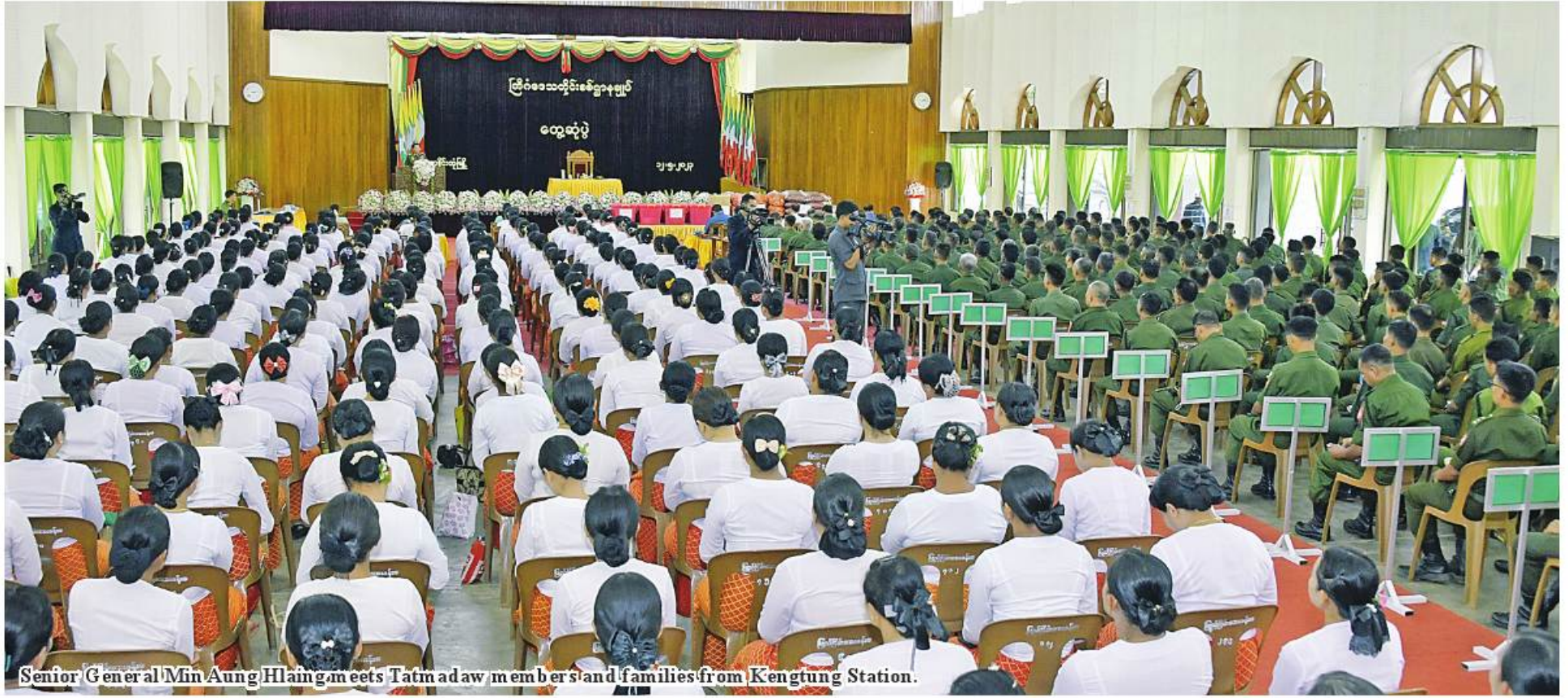
Senior General Min Aung Hlaing meets Tatmadaw members and families from Kengtung Station.