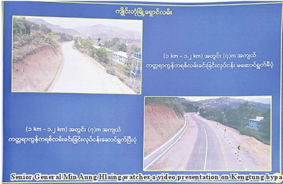
Senior General Min Aung Hlaing watches a video presentation on Kengtung bypass construction.