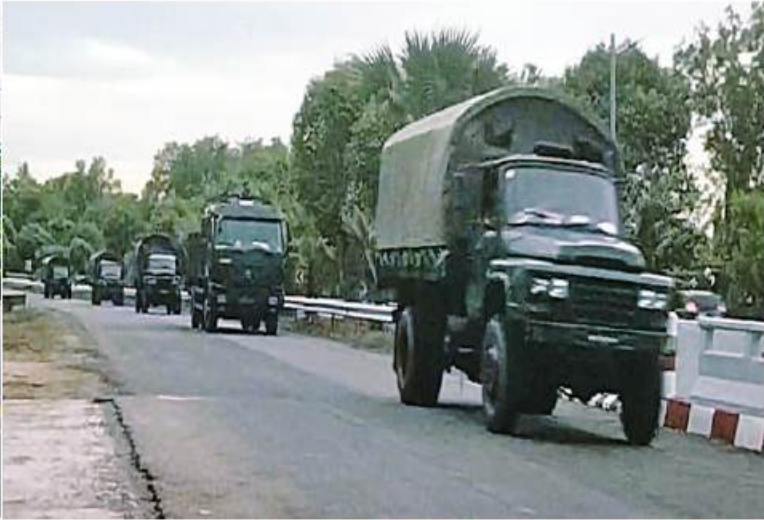
“မိုခါ” (MOCHA) ဆိုင်ကလွန်းမုန်တိုင်း ဦးတည်ဝင်ရောက်နိုင်ကြောင်း ခန့်မှန်းထားသောဒေသများသို့ တပ်မတော်ကူညီကယ်ဆယ်ရေးယာဉ်စုများ ထွက်ခွာ

နေပြည်တော် မေ ၁၂ ဘင်္ဂလားပင်လယ်အော်တွင် လေဖိအားနည်းရပ်ဝန်း စတင်ဖြစ်ပေါ်ကြောင်း မိုးလေဝသနှင့် ဇလဗေဒဌာနကြားမှဦးစီးဌာန၏ တိုင်းထွာချက်အရ သိရှိရချိန်တွင် နိုင်ငံတော် စီမံအုပ်ချုပ်ရေးကောင်စီ၏ လမ်းညွှန်ချက်နှင့်အညီ အမျိုးသားသဘာဝဘေးအန္တရာယ်ဆိုင်ရာ စီမံခန့်ခွဲမှုဌာနမှတ်တမ်းအရေပေါ် လုပ်ငန်းညှိနှိုင်းအစည်းအဝေးကို ကျင်းပ၍ သဘာဝဘေးအန္တရာယ်ဆိုင်ရာ စီမံခန့်ခွဲမှုဌာန (Disaster Mana-