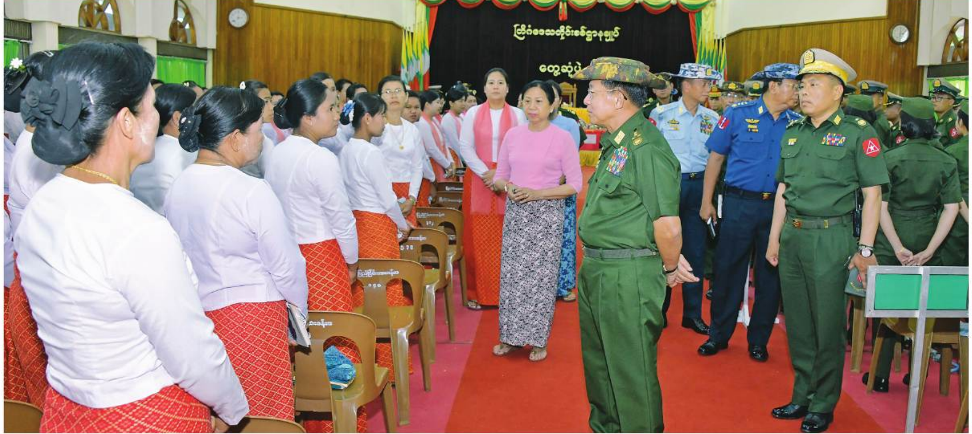
နိုင်ငံတော်စီမံအုပ်ချုပ်ရေးကောင်စီဥက္ကဋ္ဌ တပ်မတော်ကာကွယ်ရေးဦးစီးချုပ် ဗိုလ်ချုပ်မှူးကြီးမင်းအောင်လှိုင်နှင့် ဇနီး ဒေါ်ကြူကြူလှတို့က အရာရှိ စစ်သည်၊ မိသားစုများကို ရင်းရင်းနှီးနှီးလိုက်လံ နှုတ်ဆက်စဉ်။

နေပြည်တော် မေ ၁၂ - ဒေသတိုင်းစစ်ဌာနချုပ် ကျိုင်းတုံတပ်နယ်မှ အဆိုပါတွေ့ဆုံပွဲသို့ နိုင်ငံတော်စီမံအုပ်ချုပ်ရေး ဦးစီးချုပ်(လေ) ဗိုလ်ချုပ်ကြီးထွန်းအောင်နှင့် ဇနီး၊ နိုင်ငံတော်စီမံအုပ်ချုပ်ရေးကောင်စီ ဥက္ကဋ္ဌ အရာရှိ စစ်သည်၊ မိသားစုဝင်များကို တိုင်းစစ်ဌာနချုပ် ပြည်ငြိမ်းအေးခန်းမ၌ တွေ့ဆုံအမှာစကား ပြောကြားသည်။ အဆိုပါတွေ့ဆုံပွဲသို့ နိုင်ငံတော်စီမံအုပ်ချုပ်ရေး ကောင်စီဥက္ကဋ္ဌ တပ်မတော်ကာကွယ်ရေးဦးစီးချုပ် ဇနီး ဒေါ်ကြူကြူလှ၊ ကာကွယ်ရေးဦးစီးချုပ် (လေ) ဗိုလ်ချုပ်ကြီးမိုးအောင်နှင့် ဇနီး၊ ကာကွယ်ရေး ဦးစီးချုပ်(လေ) ဗိုလ်ချုပ်ကြီးထွန်းအောင်နှင့် ဇနီး၊ ကာကွယ်ရေး ကာကွယ်ရေးဦးစီးချုပ်မှူးမှ တပ်မတော်အရာရှိကြီး များနှင့် ဇနီးများ၊ တြိဂံဒေသတိုင်းစစ်ဌာနချုပ် တိုင်းမှူးနှင့် စာမျက်နှာ ၁၈ ကော်လံ ၁ ၃