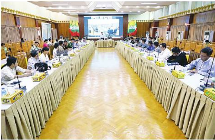
ရခိုင်ပြည်နယ် သဘာဝဘေးအန္တရာယ်ဆိုင်ရာ စီမံခန့်ခွဲမှုအဖွဲ့ လုပ်ငန်းညှိနှိုင်းအစည်းအဝေးကျင်းပခန့်

နေပြည်တော် မေ ၁၂ ဘင်္ဂလားပင်လယ်အော် အရှေ့တောင်ပိုင်းနှင့် ယင်းနှင့် ဆက်စပ်လျက်ရှိသော ကပ္ပလီပင်လယ်ပြင်တောင်ပိုင်းတွင် ဖြစ်ပေါ်လျက်ရှိသည့် လေဖိအားနည်းရပ်ဝန်းသည် တဖြည်းဖြည်းအားကောင်းလာကာ ဆိုင်ကလွန်းမုန်တိုင်းအဖြစ်သို့ရောက်ရှိလာနိုင်ပြီး ခန့်မှန်းချက်များအရ မြန်မာနိုင်ငံဘက်သို့ ဖြတ်သန်းဝင်ရောက်နိုင်သည့် အခြေအနေ ရှိနေသဖြင့် သဘာဝဘေးအန္တရာယ်ကျ ရောက်လာပါက အရေးပေါ်စီမံခန့်ခွဲခြင်း၊ တုံ့ပြန်ခြင်း၊ ကယ်ဆယ်ရေးနှင့် ပူးပေါင်းဆောင်ရွက်ခြင်း၊ အသင့်ပြင်ဆင်စုဖွဲ့ထားရှိခြင်း၊ ပြန်လည်ထူထောင်ရေးဆိုင်ရာ ကိုယ်စီလုပ်ငန်းတာဝန်များအား ဇာတ်တိုက်လေ့ကျင့်ခြင်းများကို တိုင်းဒေသကြီးနှင့် ပြည်နယ်အသီးသီး၌ ဆောင်ရွက်လျက်ရှိသည်။