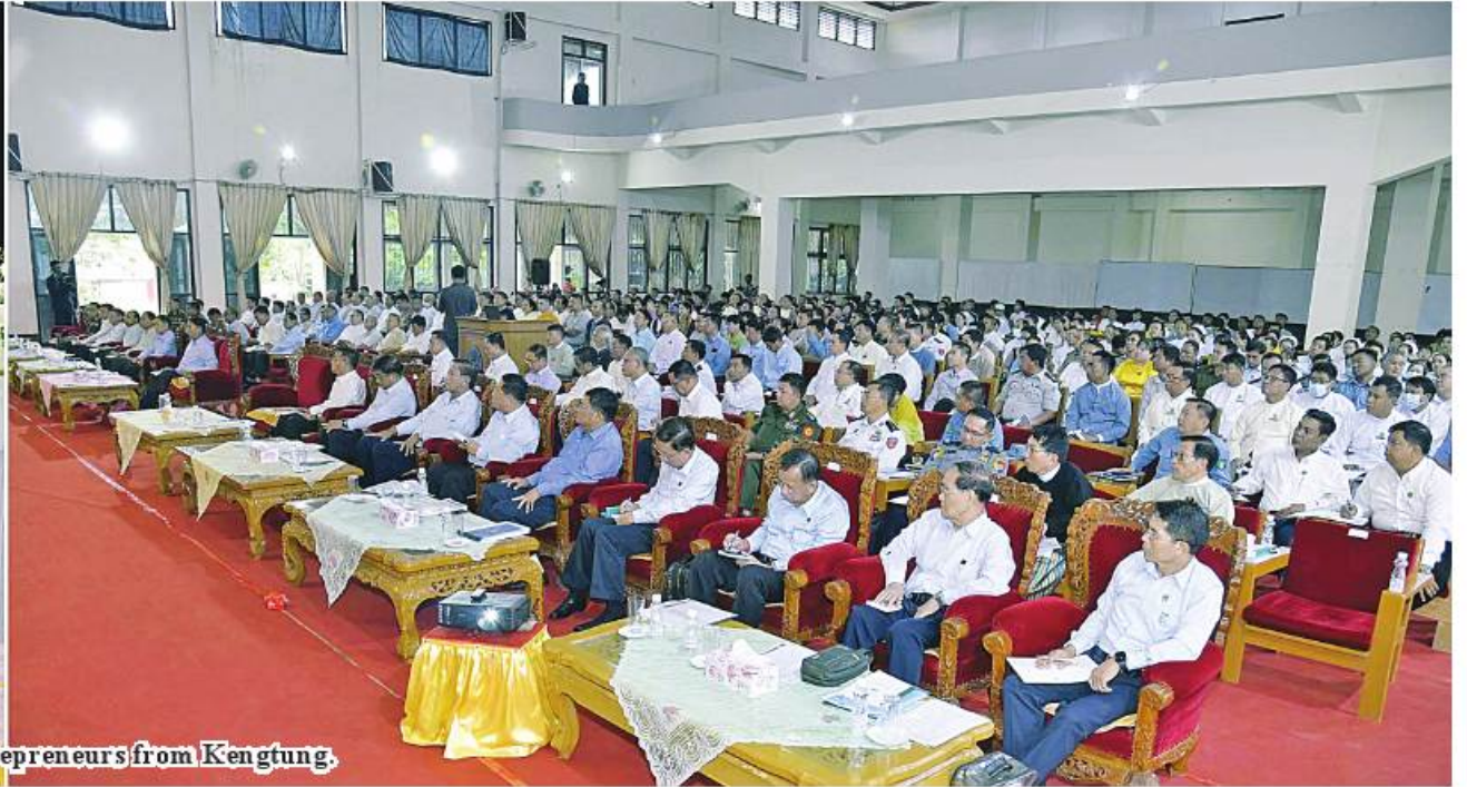
Senior General Min Aung Hlaing meets MSME entrepreneurs from Kengtung.

Nay Pyi Taw May 12 Chairman of the State Administration Council Prime Minister Senior General Min Aung Hlaing this morning met with departmental officials at State, district and township levels, town elders, and businesspersons of micro-, small- and medium-sized enterprises at the city hall in Kengtung of Shan State (East) and discussed regional development measures.