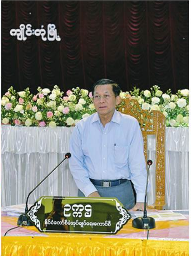
နိုင်ငံတော်စီမံအုပ်ချုပ်ရေးကောင်စီဥက္ကဋ္ဌ နိုင်ငံတော်ဝန်ကြီးချုပ် ဗိုလ်ချုပ်မှူးကြီးမင်းအောင်လှိုင် ကျိုင်းတုံမြို့ရှိ ပြည်နယ်၊ ခရိုင်၊ မြို့နယ်အဆင့် ဌာနဆိုင်ရာတာဝန်ရှိသူများ၊ မြို့မိမြို့ဖများ၊ အသေးစား၊ အငယ်စားနှင့် အလတ်စားစီးပွားရေး(MSME)လုပ်ငန်းရှင်များကို တွေ့ဆုံ၍ ဒေသဖွံ့ဖြိုးတိုးတက်ရေးဆိုင်ရာများကို ဆွေးနွေးပြောကြားစဉ်။