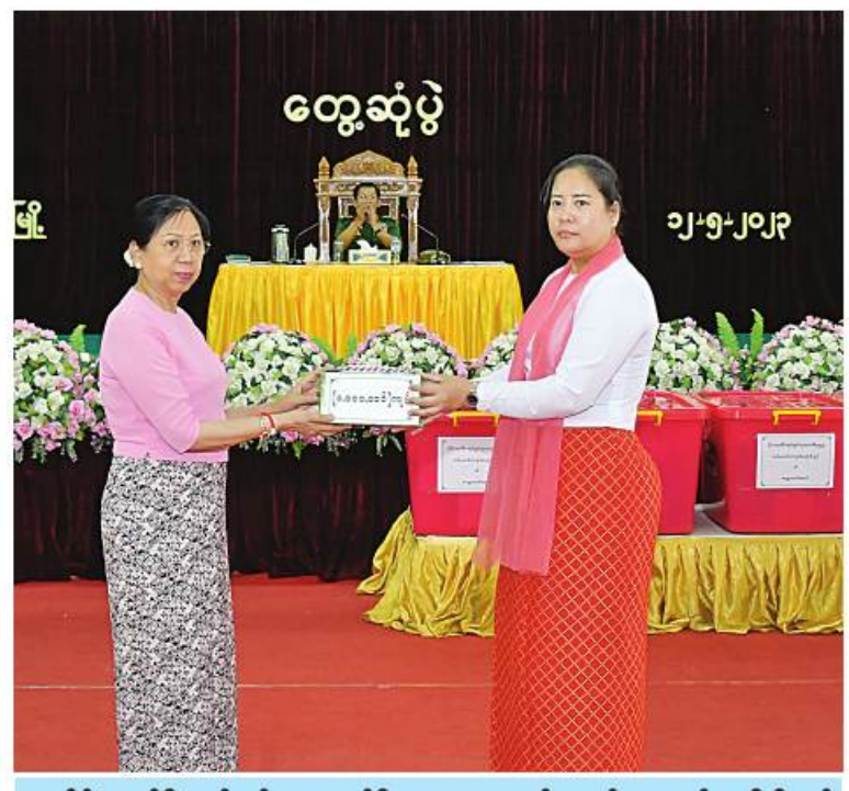
နိုင်ငံတော်စီမံအုပ်ချုပ်ရေးကောင်စီဥက္ကဋ္ဌ တပ်မတော်ကာကွယ်ရေးဦးစီးချုပ် ဗိုလ်ချုပ်မှူးကြီးမင်းအောင်လှိုင်၏ ဓနိ ဒေါ်ကြူကြူလှက တပ်နယ်မိခင်နှင့် ကလေးစောင်ရှောက်ရေးအသင်းအတွက် ချီးမြှင့်ငွေများကို ပေးအပ်စဉ်။

ပိတ်စွဲဒီမိုကရေစီအထွေထွေရွေးကောက်ပွဲကို မဖြစ်မနေအနိုင်ရရှိရေးအတွက် မသမာသည့်နည်းလမ်းများဖြင့်ဆောင်ရွက်ခဲ့ကြောင်း၊ ထို့ကြောင့် တပ်မတော်မှ မဲစာရင်းများမှန်ကန်မှုရှိစေရေးစီမံဆောင်ရွက်ခဲ့ကြောင်း၊ မဲစာရင်းမှားယွင်းမှုများကို ဖြေရှင်းပေးနိုင်ရေး တာဝန်ရှိသူများထံ အကြောင်းကြားခဲ့သော်လည်း ဖြေရှင်းပေးမှုမရှိဘဲ လွှတ်တော်ခေါ်ယူ၍ နိုင်ငံတော်၏အာဏာကို အဓမ္မရယူရန်ကြိုးပမ်းခဲ့ခြင်းကြောင့် တပ်မတော်အနေဖြင့် နိုင်ငံတော်တာဝန်ကို ဝင်ရောက်ထမ်းဆောင်ခဲ့ရခြင်းဖြစ်ကြောင်း၊ မိမိတို့အနေဖြင့် ဖွဲ့စည်းပုံအခြေခံဥပဒေနှင့်အညီ နိုင်ငံတော်တာဝန်ကို ထမ်းဆောင်ခဲ့ခြင်းဖြစ်ကြောင်း၊ နိုင်ငံတော်စီမံအုပ်ချုပ်ရေးကောင်စီ၏ ရွေ့လုပ်ငန်းစဉ်တွင် ရွေးကောက်ပွဲပြန်လည်ကျင်းပ၍ အနိုင်ရသည်ပိတ်အား