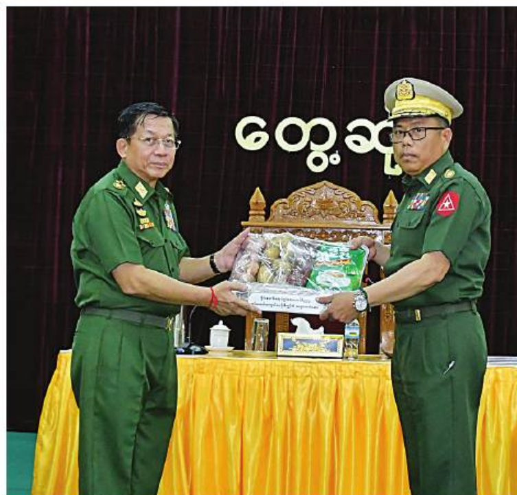
နိုင်ငံတော်စီမံအုပ်ချုပ်ရေးကောင်စီဥက္ကဋ္ဌ တပ်မတော်ကာကွယ်ရေးဦးစီးချုပ် ဗိုလ်ချုပ်မှူးကြီးမင်းအောင်လှိုင်က ကျိုင်းတုံတပ်နယ်မှ အရာရှိ၊ စစ်သည်၊ မိသားစုများအတွက် စားသောက်ဖွယ်ရာပစ္စည်းများကို ပေးအပ်စဉ်။

ထိုသို့တွေ့ဆုံအမှာစကားပြောကြားရာ ဤဒေသတိုင်းစစ်ဌာနချုပ် ကျိုင်းတုံတပ်နယ်ရှိ အရာရှိ၊ စစ်သည်၊ မိသားစုများအားလုံးကို ယခုကဲ့သို့တွေ့ဆုံရသည်အတွက် ဝမ်းမြောက်မိပါကြောင်း၊ နိုင်ငံတော်တွင်ဖြစ်ပေါ်ခဲ့သည့် အခြေအနေများအရ တပ်မတော်အနေဖြင့် နိုင်ငံတော်၏တာဝန်များကိုထမ်းဆောင်ခဲ့ရပြီး ယင်းကာလသည် ကိုဗစ်-၁၉ ရောဂါဖြစ်ပွားမှုများ ပြင်းထန်ချိန်၊ စီးပွားရေးကျဆင်းနေချိန်ဖြစ်ကြောင်း၊ အလားတူ နိုင်ငံရေးအရမတည်ငြိမ်မှုများ ဖြစ်ပေါ်နေချိန်လည်းဖြစ်ကြောင်း၊ ယေဘုယျအားဖြင့် ဒီမိုကရေစီစနစ်ကိုကျင့်သုံးနေချိန်ဖြစ်သဖြင့် စီးပွားရေးကောင်းမွန်သည်ဟု ထင်ရသော်လည်း နိုင်ငံတော်အနေဖြင့် ပြည်ပကြွေးမြီများ များပြားလျက်ရှိကြောင်း၊ စီမံခန့်ခွဲမှုအားနည်းခဲ့မှုများကြောင့် နိုင်ငံ၏ စီးပွားရေးမှာ အနုတ်လက္ခဏာအထိရှိခဲ့ကြောင်း၊ ထို့ကြောင့် မိမိတို့တာဝန်ယူရသည့်အချိန်တွင် နိုင်ငံစီးပွားမြှင့်တင်ရေးအတွက် အလေးပေးဆောင်ရွက်ခဲ့ကြောင်း၊ ကိုဗစ်-၁၉ ရောဂါ ကာကွယ်၊ ကုသ၊ ထိန်းချုပ်ရေးလုပ်ငန်းများကိုလည်း အရှိန်အဟုန်ဖြင့် ကြိုးပမ်းဆောင်ရွက်ခဲ့ပြီး တာဝန်ကျေပွန်သည် ကျန်းမာရေးဝန်ထမ်းများ၊ လူမှုရေးအဖွဲ့အစည်းများနှင့် ပြည်သူများအားလုံးမှ ဝိုင်းဝန်းပါဝင်ဆောင်ရွက်မှုများ၊ အိမ်နီးချင်း နိုင်ငံများနှင့် မိတ်ဆွေနိုင်ငံများ၏ကူညီပေးမှုများကြောင့် အချိန်အတိုင်းအတာတစ်ခုအတွင်း ထိန်းချုပ်နိုင်ခဲ့ကြောင်း။