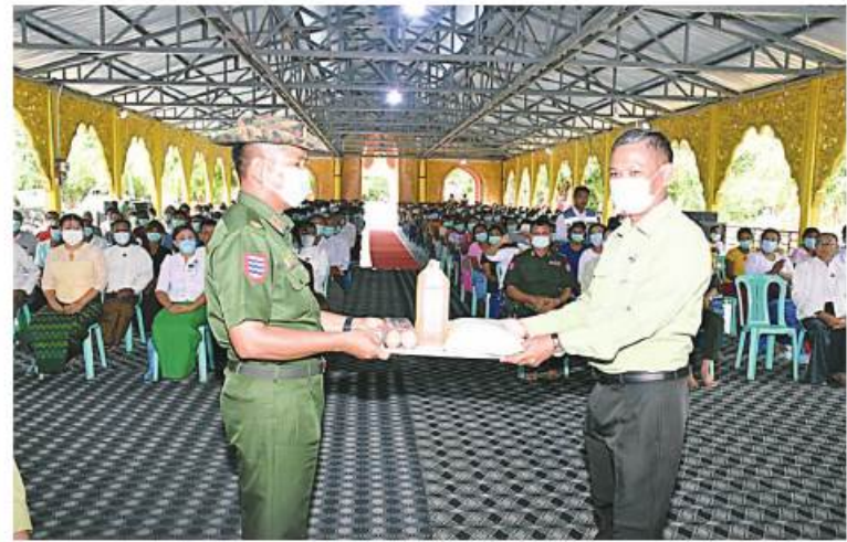
အနောက်တောင်တိုင်းစစ်ဌာနချုပ် တိုင်းမှူး ဗိုလ်မှူးချုပ်ကြည်ခိုင် မုန်တိုင်းဘေးရောင်ပြည်သူများကို စားသောက်ဖွယ်ရာများပေးအပ်ခန့်

တိုင်းစစ်ဌာနချုပ် တိုင်းမှူး ဗိုလ်မှူးချုပ်ကြည်ခိုင်နှင့် တာဝန်ရှိသူများက သွားရောက်တွေ့ဆုံအားပေးစကားပြောကြားပြီး ဆန်းဆီ၊ ကြက်ဥနှင့် စားသောက်ဖွယ်ရာများ ပေးအပ်ကာ လိုအပ်သည်များ ညှိနှိုင်းဆောင်ရွက်ပေးပြီး လပွတ္တာမြို့နယ် ဇင်ရွဲလေးကျေးရွာနှင့် သက်န်းကြီးကျေးရွာတို့ရှိ မုန်တိုင်းဒဏ်ခံကာကွယ်ခိုလှုံရေး အဆောက်အအုံ (Cyclone Shelter) များ ပြင်ဆင်ဆောင်ရွက်ထားရှိမှုများနှင့် ရိက္ခာအမည်ငါးမျိုးနှင့် သောက်သုံးရေလုံလောက်စွာ ရရှိရန် ဆောင်ရွက်ထားရှိမှုအခြေအနေများကို ကြည့်ရှုစစ်ဆေးသည်။ ထို့ပြင် သဘာဝဘေးအန္တရာယ်ဆိုင်ရာ စီမံခန့်ခွဲမှုအဖွဲ့ လုပ်ငန်းညှိနှိုင်းအစည်းအဝေးများကို ယနေ့တွင် ရခိုင်ပြည်နယ် စစ်တွေမြို့ရှိ ပြည်နယ်အစိုးရအဖွဲ့ရုံး အစည်းအဝေးခန်းမ၌လည်းကောင်း၊ ချင်းပြည်နယ် ဟားခါးမြို့နယ်ရှိ ပြည်နယ်အစိုးရအဖွဲ့ရုံး အစည်းအဝေးခန်းမ၌ လည်းကောင်း အသီးသီးပြုလုပ်ကြရာ ပြည်နယ်ဝန်ကြီးချုပ်များ၊ တိုင်းမှူးများနှင့် တာဝန်ရှိသူများ တက်ရောက်ကြပြီး ပြည်နယ်ဝန်ကြီးချုပ်များက အမှာစကားများ အသီးသီးပြောကြားကာ အစည်းအဝေးတက်ရောက်လာသူများ၏ တင်ပြချက်များအပေါ် လိုအပ်သည်များ ပေါင်းစပ်ညှိနှိုင်းဆောင်ရွက်ပေးခဲ့ကြကြောင်း သတင်းရရှိသည်။