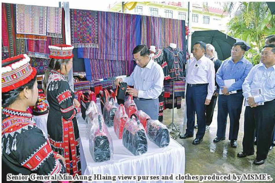
Senior General Min Aung Hlaing views purses and clothes produced by MSMEs.

region, progress of improving domestic tea industry, upgrading roads in poor facility of transport in some areas, assistance for service personnel in smooth transport in discharging duties in the region as transport charge is high in Shan State (East), installation of telephone lines for convenience of the region in communication difficulties, and requirements for development of businesses.