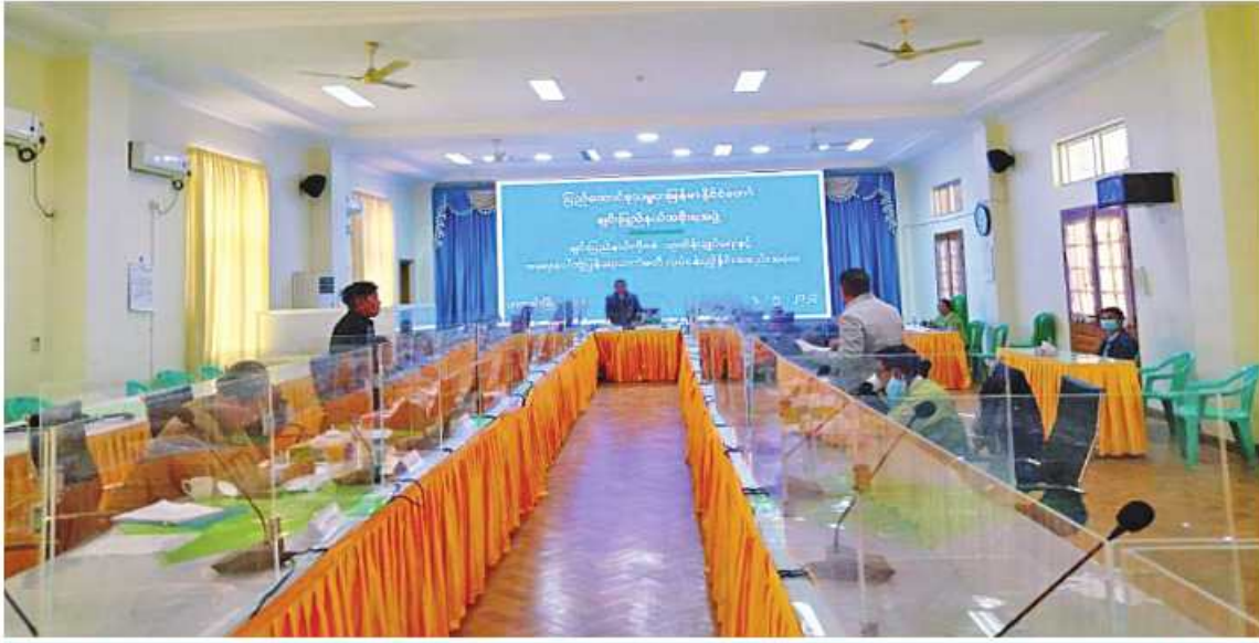
ချင်းပြည်နယ်အတွင်းဆောင်ရွက်လျက်ရှိသည့် ကိုဗစ်-၁၉ ရောဂါ ကာကွယ်၊ ထိန်းချုပ်၊ ကုသရေးနှင့် အရေးပေါ်တုံ့ပြန်ရေးကော်မတီ၏ လုပ်ငန်းညှိနှိုင်းအစည်းအဝေးကျင်းပစဉ်။