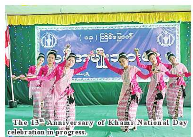
The 13 th Anniversary of Khami National Day celebration in progress.

tives of Maramagyi, Daingnet (a) Thekkama, Thet and Chin ethnics including Rakhine nationals and the Rakhine State Ministers for Ethnic Affairs and the Economic Affairs. The ceremony comprised traditional dances of Rakhine ethnics, Khami traditional dances, Daingnet (a) Thetkama ethnic dances. Moreover, an exhibition