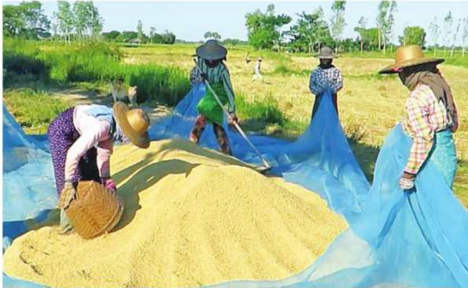
မြောင်းမြ မေ ၄