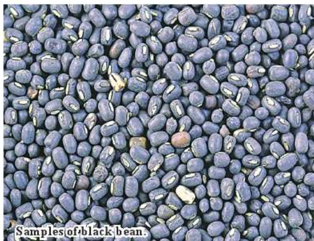
Samples of black bean.

regard, earnings from black bean reached US$14.937 million, green gram US$11.895 million and pigeon pea US$7.757 million. 336