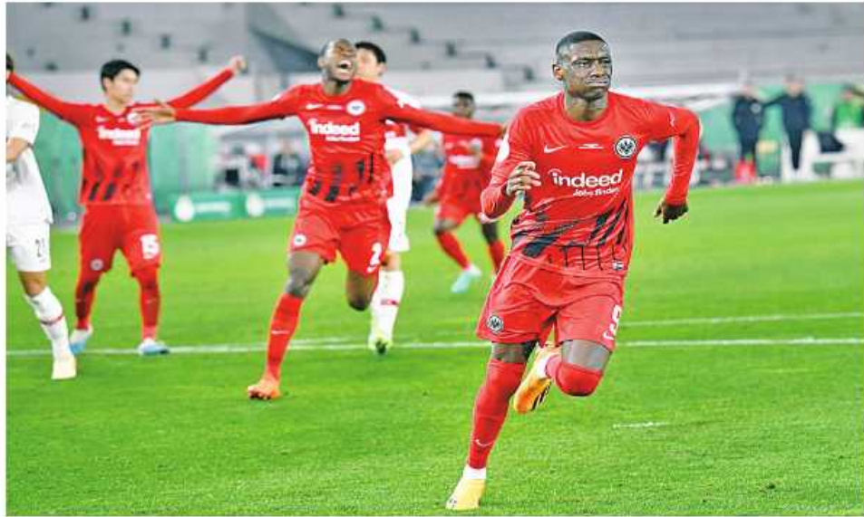
ဘာလင် ၆ ငှ

ဂျာမနီပိုကယ်ဖလား ဆီမီး ပိုင်နယ်ပွဲစဉ်အဖြစ် စတုဂတ် အသင်းနှင့် ဖရန့်ဖတ်အသင်းတို့ ယှဉ်ပြိုင်ခဲ့ရာတွင် ဖရန့်ဖတ်အသင်းက သုံးဂိုး နှစ်ဂိုးဖြင့် အနိုင်ရခဲ့သဖြင့် ဝိုက်လှုပ်တက်ရောက်ခဲ့ပြီး လက်ရှိ ချန်ပီယံ လိုက်ပေအသင်းနှင့် တွေ့ဆုံနေကြောင်း Fotmob.com က ယနေ့တွင် ဖော်ပြခဲ့သည်။