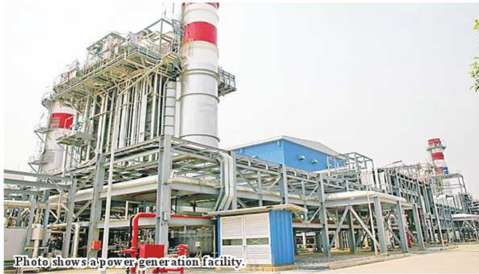
Photo shows a power generation facility.