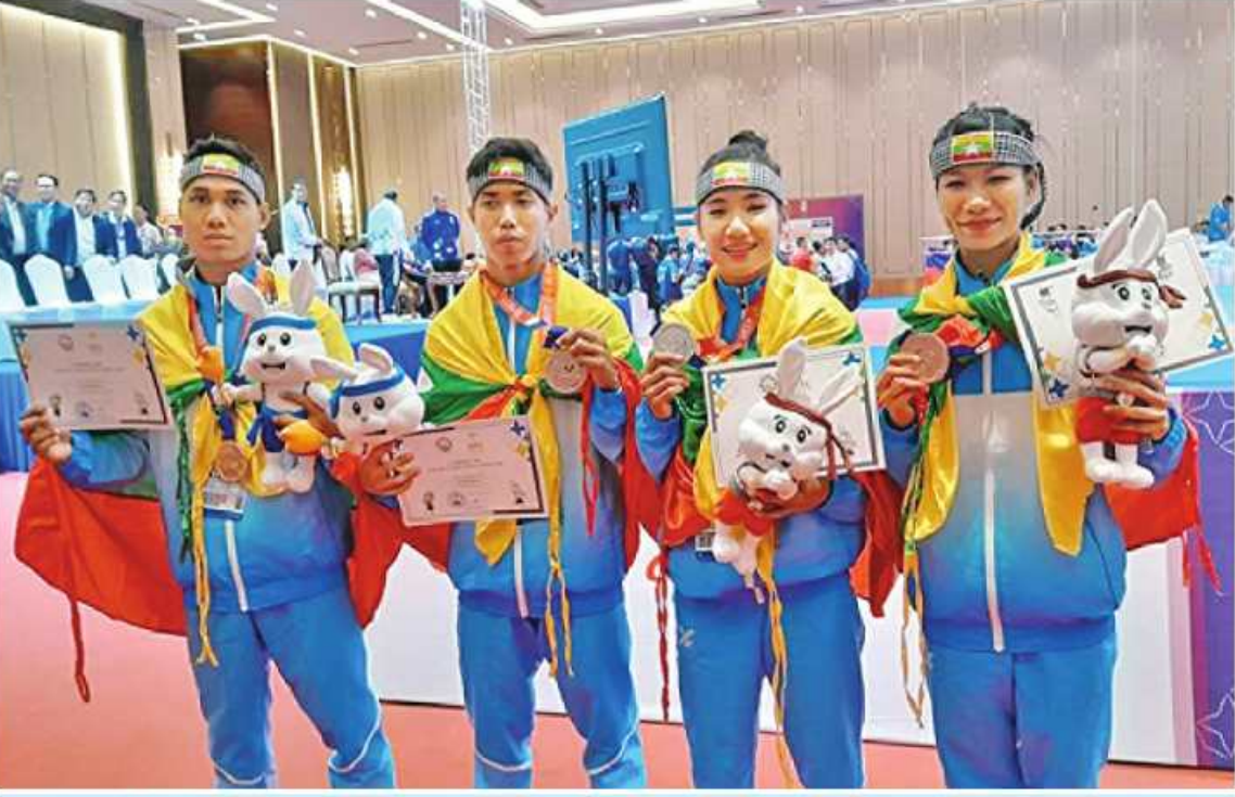
(၃၂)ကြိမ်မြောက် အရှေ့တောင်အာရှအားကစားပြိုင်ပွဲတွင် ငွေတံဆိပ် တစ်ခုနှင့် ကြေးတံဆိပ် သုံးခုရရှိခဲ့သည့် ဗိုလ်ချုပ်အားကစားအဖွဲ့ကို တွေ့ရစဉ်။

ရန်ကုန် ၈ ၄ ကမ္ဘောဒီးယားနိုင်ငံက အိမ်ရှင်အဖြစ် လက်ခံကျင်းပလျက်ရှိသည့် (၃၂)ကြိမ်မြောက် အရှေ့တောင်အာရှအားကစားပြိုင်ပွဲ(ဆီးဂိမ်း)တွင် ယနေ့ကျင်းပသည့် ပြိုင်ပွဲများအပြီး နိုင်ငံအလိုက် ဆုရရှိမှုစာရင်းတွင် မြန်မာနိုင်ငံက အဆင့်(၆)၌ ရပ်တည်လျက်ရှိကြောင်း သိရသည်။ ယနေ့ကျင်းပခဲ့သည့် ပြိုင်ပွဲများအပြီး နိုင်ငံအလိုက် ဆုရရှိမှုစာရင်း၌ အိမ်ရှင်ကမ္ဘောဒီးယားနိုင်ငံက ရွှေတံဆိပ် ငါးခု၊ ငွေတံဆိပ် လေးခု စုစုပေါင်း ဆုတံဆိပ် ကိုးခုဖြင့် ထိပ်ဆုံးက ဦးဆောင်လျက်ရှိနေပြီး မြန်မာနိုင်ငံက ငွေတံဆိပ်တစ်ခု၊ ကြေးတံဆိပ် သုံးခု စုစုပေါင်း ဆုတံဆိပ် လေးခုဖြင့် အဆင့်(၆)တွင် ရပ်တည်လျက်ရှိသည်။ စာမျက်နှာ ၁၉ ကော်လံ ၁ ☆