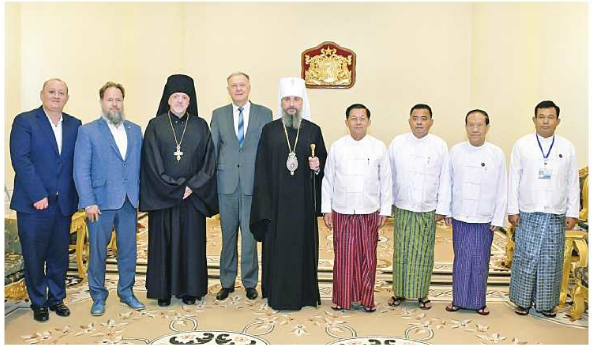
Senior General Min Aung Hlaing

Nay Pyi Taw May 4 At the meeting matters relating to good diplomatic relations between the two countries and programs to further enhance them, exchange of cultural and religious programs, further enhancement of government to government and people to people relations through cordial religious ties, Orthodox