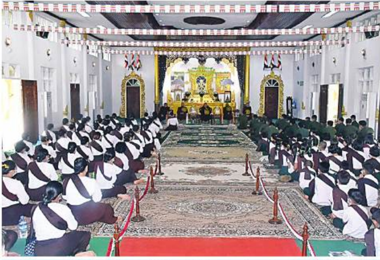
အရှေ့တောင်တိုင်းစစ်ဌာနချုပ်နှင့် ကွပ်ကဲမှုအောက် တပ်နယ်၊ တပ်ရင်း၊ တပ်ဖွဲ့များ၌ နွေရာသီသင်တန်းများ ဖွင့်ပွဲအခမ်းအနားကျင်းပစဉ်။