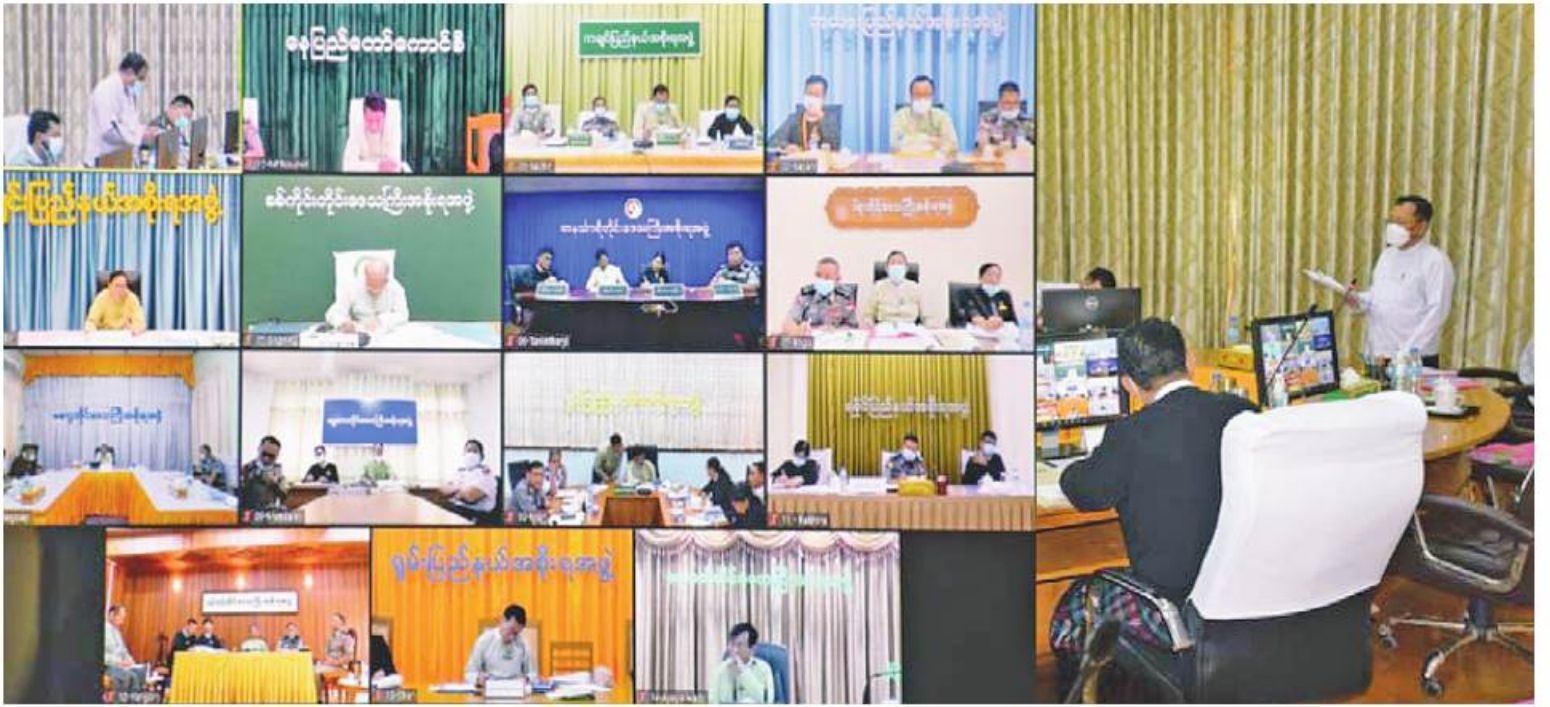
တရားရုံးစစ်ဆေးဆဲ ပြစ်မှုဆိုင်ရာမှုခင်းများတရားစီရင်ရေးအထောက်အကူပြုအဖွဲ့ ဥက္ကဋ္ဌ ဒုတိယဝန်ကြီးချုပ်နှင့် ပြည်ထဲရေးဝန်ကြီးဌာန ပြည်ထောင်စုဝန်ကြီး ဒုတိယဗိုလ်ချုပ်ကြီးစိုးထွဋ် တရားရုံးစစ်ဆေးဆဲ ပြစ်မှုဆိုင်ရာမှုခင်းများတရားစီရင်ရေးအထောက်အကူပြုအဖွဲ့အစည်းအဝေး(၁/၂၀၂၃)တွင် အမှာစကားပြောကြားစဉ်။

တရားရုံးစစ်ဆေးဆဲ ပြစ်မှုဆိုင်ရာမှုခင်းများတရားစီရင်ရေးအထောက်အကူပြုအဖွဲ့ (၁/၂၀၂၃) အစည်းအဝေးကို ယနေ့နံနက် ၉ နာရီတွင် ရုံးအမှတ်(၁၀) ပြည်ထဲရေးဝန်ကြီးဌာန အစည်းအဝေးခန်းမ၌ ကျင်းပရာ တရားရုံးစစ်ဆေးဆဲ ပြစ်မှုဆိုင်ရာမှုခင်းများ တရားစီရင်ရေးအထောက်အကူပြုအဖွဲ့ ဥက္ကဋ္ဌ ဒုတိယဝန်ကြီးချုပ်နှင့် ပြည်ထဲရေးဝန်ကြီးဌာန ပြည်ထောင်စုဝန်ကြီး ဒုတိယဗိုလ်ချုပ်ကြီးစိုးထွဋ်၊ အဖွဲ့ဝင်များဖြစ်သည့် ပြည်ထဲရေးဝန်ကြီးဌာန ဒုတိယဝန်ကြီး၊ အဂတိလိုက်စားမှုတိုက်ဖျက်ရေးကော်မရှင်အတွင်းရေးမှူး၊ အမြဲတမ်းအတွင်းဝန်များ၊ ညွှန်ကြားရေးမှူးချုပ်များ၊ ဒုတိယရဲချုပ်၊ ဒုတိယညွှန်ကြားရေးမှူးချုပ်များအပါအဝင် ဖိတ်ကြားထားသူ ၁၂ ဦး၊ Online ဖြင့် နေပြည်တော်၊ တိုင်းဒေသကြီး၊ ပြည်နယ် တရားစီရင်ရေးဆိုင်ရာကိစ္စရပ်များပေါင်းစပ်ညှိနှိုင်းရေးအဖွဲ့ အဖွဲ့ခေါင်းဆောင်များနှင့် အဖွဲ့ဝင် ၇၅ ဦး စုစုပေါင်း ၈၇ ဦး တက်ရောက်ကြသည်။