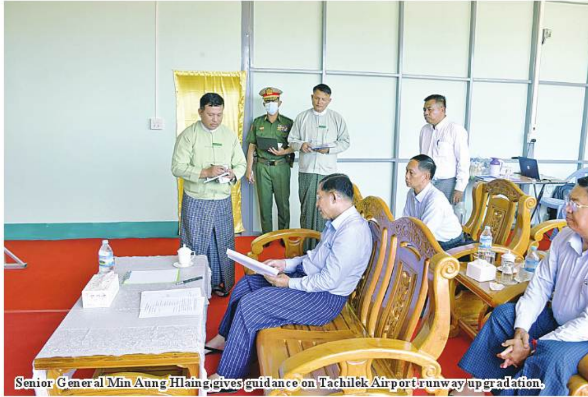
Senior General Min Aung Hlaing gives guidance on Tachilek Airport runway upgradation.

inspected runway upgrading of Tachilek Airport this afternoon.