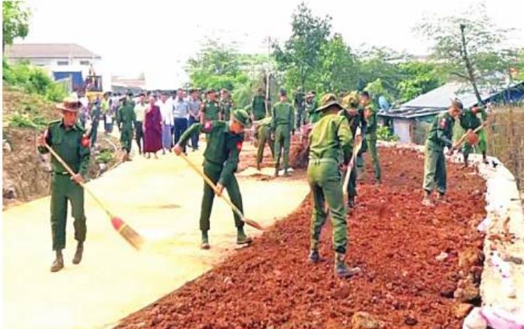
အရှေ့တောင်တိုင်းစစ်ဌာနချုပ် တိုင်းမှူး၊ ဝိုင်းမှူးချုပ်စိုးမင်းနှင့် လင်းခေးမြို့ရှိ မန်ချာဘုရားကြီးကျောင်းတိုက်အတွင်း သန့်ရှင်းရေးဆောင်ရွက်နေမှုများကို ကြည့်ရှုအားပေးစဉ်။

စစ်ကိုင်းတိုင်းဒေသကြီးအတွင်းရှိ မြို့နယ် ၃ နယ်၊ မြို့နယ်တို့၌လည်းကောင်း၊ မန္တလေးတိုင်းဒေသကြီးအတွင်းရှိ မြို့နယ် ၁၀ မြို့နယ်တို့၌လည်းကောင်း၊ ဘုရား၊ စေတီပုထိုးများ၊ ဌာနဆိုင်ရာအဆောက်အအုံများ၊ အခြေခံပညာကျောင်းများ၊ တက္ကသိုလ်များ၊ ဆေးရုံများ၊ ဘိုးဘွားရိပ်သာများ၊ ဈေးရုံများ၊ ပန်းခြံများနှင့် လမ်းတံတားများ၌ ဒေသခံပြည်သူများ၊ အုပ်ချုပ်ရေးအဖွဲ့အစည်းများ၊ စည်ပင်သာယာရေးအဖွဲ့များ၊ ကြက်ခြေနီတပ်ဖွဲ့ဝင်များ၊ ဌာနဆိုင်ရာဝန်ထမ်းများ၊ စစ်မှုထမ်းဟောင်းအဖွဲ့ဝင်များ၊ ပြည်သူ့စစ်တပ်ဖွဲ့ဝင်များ၊ တပ်မတော်သားများ၊ မြန်မာနိုင်ငံရဲတပ်ဖွဲ့ဝင်များနှင့် မီးသတ်တပ်ဖွဲ့ဝင်များက ချဲ့နွယ်ပေါင်းမြက်များ ခုတ်ထွင်ရှင်းလင်းခြင်း၊ အမှိုက်များရှင်းလင်းခြင်းနှင့် ရေစီးရေလာကောင်းမွန်စေရေး ရေနုတ်မြောင်းများတူးဖော်ပေးခြင်းတို့ကို ဆောင်ရွက်ပေးကြသည်။ ထို့ပြင် မန္တလေးမြို့ပေါ်ရှိ တာဝန်သိလူငယ်လူရွယ်များစုစည်း၍ “မြို့ရွာသန့်ရှင်းရေးဂရုတစိုက်” စာသားတံဆိပ်ပါ တူညီဝတ်စုံများဝတ်ဆင်ပြီး မဟာအောင်မြေမြို့နယ် ဝန်းမော်ကျောင်းတိုက်ဝင်းအတွင်း၌ စုပေါင်းအမှိုက်ကောက်ခြင်းနှင့် ရပ်ကွက်နေပြည်သူများ တစ်ဖက်တစ်လမ်းမှ သက်သာချောင်ချိမှု ရှိစေရန် ပြည်သူများထံမှ အမှိုက်တစ်ပိဿာလျှင် ၁၀၀ ကျပ်ဖြင့်ဝယ်ယူ၍ စနစ်တကျ အမှိုက်စွန့်ပစ်ခြင်းများကို ဆောင်ရွက်ကြသည်။ ယင်းသို့ ဆောင်ရွက်ပေးနေမှုများကို သက်ဆိုင်ရာ တိုင်းစစ်ဌာနချုပ်အသီးသီးမှ တိုင်းမှူးများနှင့် တာဝန်ရှိသူများက လိုက်လံကြည့်ရှုအားပေးပြီး လိုအပ်သည်များ ညှိနှိုင်းဆောင်ရွက်ပေးခဲ့ကြကြောင်း သတင်းရရှိသည်။