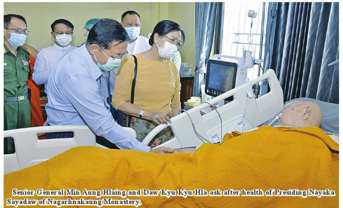
Senior General Min Aung Hlaing and Daw Kyu Kyu Hla ask after health of Presiding Nayaka Sayadaw of Nagarhnakaung Monastery.

of the presiding Sayadaw, attending to the needs and systematic arrangements for visitors to pay obeisance to the Sayadaw depending on the health of the Sayadaw.