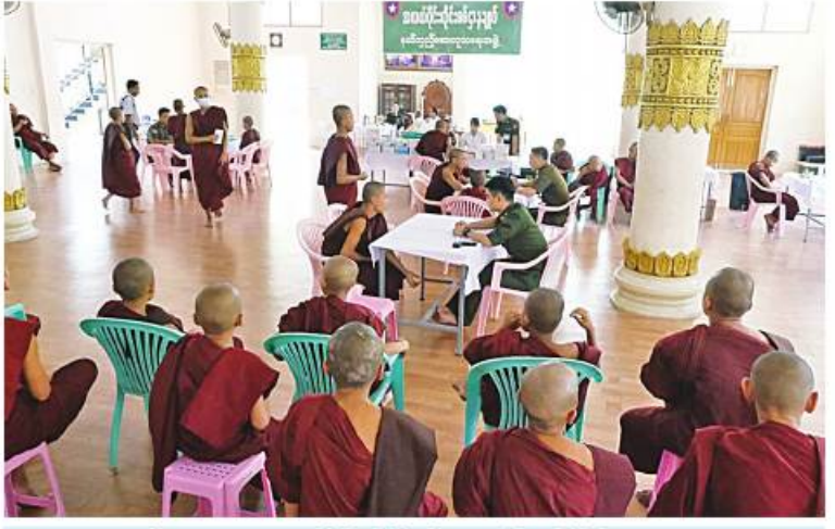
သံဃာတော်များအား အလယ်ပိုင်းတိုင်းစစ်ဌာနချုပ် နယ်မြေခံဆေးကုသရေးအဖွဲ့က ကျန်းမာရေးစောင့်ရှောက်မှုလုပ်ငန်းများ ဆောင်ရွက်ပေးစဉ်။

နေပြည်တော် ၈ ဇူလိုင် ၂၀၂၃ စစ်ကိုင်းတိုင်းဒေသကြီး မုံရွာမြို့နယ် အတွင်းရှိ သံဃာတော်များနှင့် ဒေသခံပြည်သူများကို အနောက်မြောက်တိုင်းစစ်ဌာနချုပ် နယ်မြေခံဆေးကုသရေးအဖွဲ့က ယနေ့တွင် မီးတောကျေးရွာ အခြေခံပညာမူလတန်းကျောင်း၌ ကျန်းမာရေးစောင့်ရှောက်မှုလုပ်ငန်းများ ဆောင်ရွက်ပေးသည်။ တိုင်းစစ်ဌာနချုပ် နယ်မြေခံဆေးကုသရေးအဖွဲ့က သံဃာတော်များနှင့် ဒေသခံပြည်သူ ၆၇ ဦးကို သွေးတိုးရောဂါ၊ နား၊ နှာခေါင်း၊ လည်ချောင်းရောဂါ၊ မျက်စိရောဂါ၊ သွားနှင့်ခံတွင်းရောဂါ၊ အထွေထွေရောဂါတို့နှင့်ပတ်သက်၍ လိုအပ်သည့် ကျန်းမာရေးစောင့်ရှောက်မှုလုပ်ငန်းများ ဆောင်ရွက်ပေးသည်။ အလားတူ မန္တလေးတိုင်းဒေသကြီး မဟာအောင်မြေမြို့နယ်အတွင်းရှိ သံဃာတော်များနှင့် ဒေသခံပြည်သူများကို အလယ်ပိုင်းတိုင်းစစ်ဌာနချုပ် နယ်မြေခံဆေးကုသရေးအဖွဲ့က ယနေ့တွင် မဟာအောင်မြေမြို့နယ် သံလျက်မော် အရှေ့ရပ်ကွက် အဝေရာရာမရန်ကင်းကျောင်းတိုက်၌ ကျန်းမာရေးစောင့်ရှောက်မှု