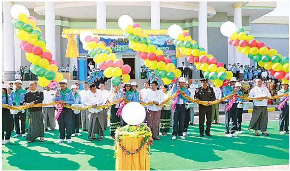
စေလိုကြောင်း ပြောကြားသည်။ ထို့နောက် ပြည်နယ်ဝန်ကြီးချုပ်က နှုတ်ခွန်းဆက်စကားပြောကြားသည်။ ယင်းနောက် ပြည်ထောင်စုဝန်ကြီးက

ယင်းနောက် ဒုတိယပိုင်းအခမ်းအနား ကို ဘွဲ့နှင်းသဘင်ခန်းမ၌ ဆက်လက် ကျင်းပရာ ပြည်ထောင်စုဝန်ကြီးက လူရည်ချွန်လူငယ်မောင်မယ်များအနေဖြင့် ကျောင်းသား၊ ကျောင်းသူများ၏ စံနမူနာ ပြုလုပ်မှုများ ပေါ်ထွန်းလာစေရန် စသည့် အချက်များနှင့်ပြည့်စုံအောင် ကြိုးစားသွား ကြစေလိုကြောင်း၊ ဆက်လက်သင်ယူရမည့် ပညာရပ်နယ်ပယ်များတွင် ထူးချွန်ထက် မြတ်အောင် ဆက်လက်အားထုတ်ကြိုးပမ်း ကြရန်နှင့် တတ်မြောက်ထားသည့် အသိ ပညာ အတတ်ပညာများဖြင့် မိမိတို့ဒေသ၊ ဌာန၊ အဖွဲ့အစည်းကို ကောင်းမွန်စွာ ခေါင်းဆောင်မှုပေးနိုင်ရန် အနာဂတ် နိုင်ငံတော်၏ ခေါင်းဆောင်ကောင်းဖြစ် အောင် ရည်မှန်းကြိုးပမ်းဆောင်ရွက်ကြ