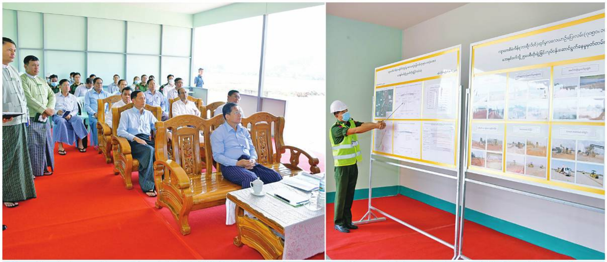
နိုင်ငံတော်စီမံအုပ်ချုပ်ရေးကောင်စီဥက္ကဋ္ဌ နိုင်ငံတော်ဝန်ကြီးချုပ် ဗိုလ်ချုပ်မှူးကြီးမင်းအောင်လှိုင်အား တာဝန်ရှိသူတစ်ဦးက တာချီလိတ်လေယာဉ်ကွင်း၊ လေယာဉ်ပြေးလမ်းအဆင့်မြှင့်တင်မှုအခြေအနေများ နှင့်ပတ်သက်၍ ရှင်းလင်းတင်ပြစဉ်။

(နိုင်ငံတော်စီမံအုပ်ချုပ်ရေးကောင်စီဥက္ကဋ္ဌ နိုင်ငံတော်ဝန်ကြီးချုပ် ဗိုလ်ချုပ်မှူးကြီးမင်းအောင်လှိုင်၏ ၂၀၂၂ ခုနှစ် နိုဝင်ဘာ ၁၁ ရက် တွင်ပြုလုပ်သော နိုင်ငံတော်စီမံအုပ်ချုပ်ရေးကောင်စီအစည်းအဝေး (၉/၂၀၂၂)တွင် အမှာစကားပြောကြားမှုမှ ကောက်နုတ်ချက်)