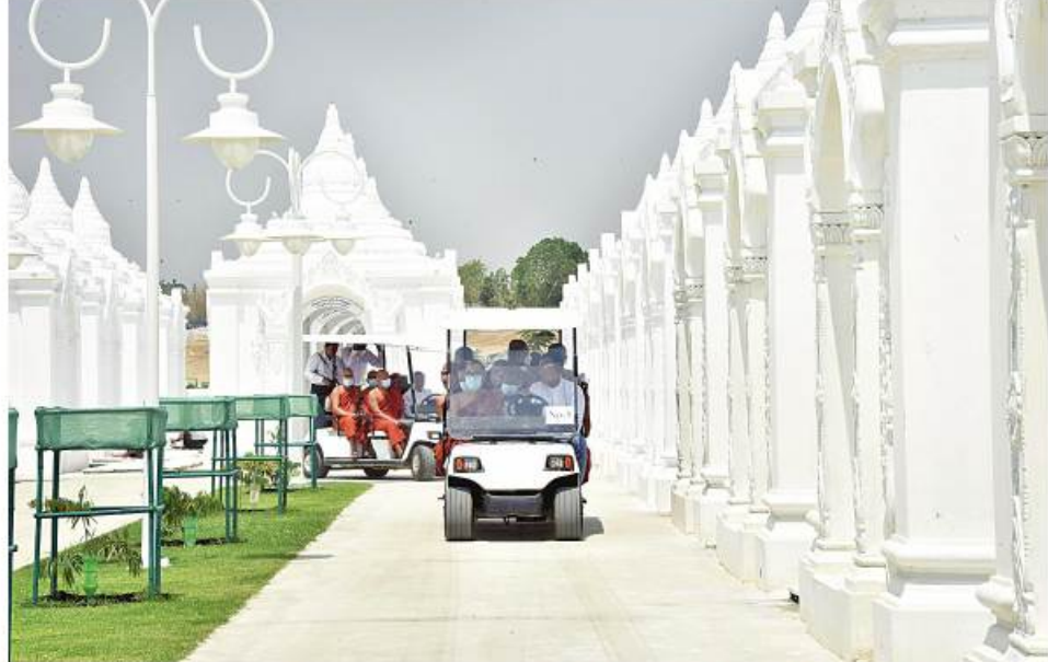
ဆရာတော်၊ သံဃာတော်ကြီးများက ကျောက်စာရုံစေတီတော်များ တည်ဆောက်ပြီးစီးမှုအခြေအနေများအား လှည့်လည်လေ့လာဖူးမြော်ကြည်ညိုစဉ်။