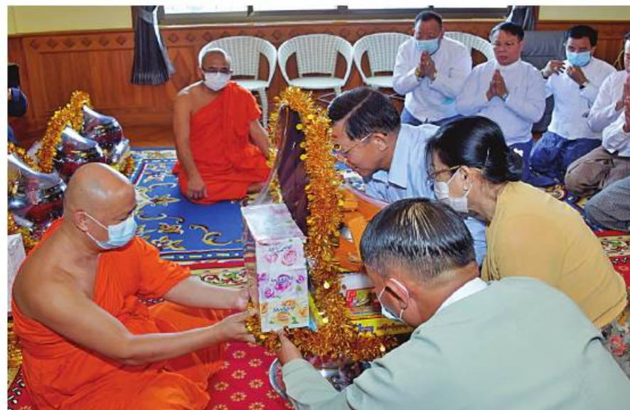
တာချီလိတ်မြို့ နဂါးနှစ်ကောင်ကျောင်းတိုက် လက်ထောက်ကျောင်းထိုင် ဆရာတော် ဘဒ္ဒန္တသုဓမ္မအား နိုင်ငံတော်စီမံအုပ်ချုပ်ရေးကောင်စီဥက္ကဋ္ဌ နိုင်ငံတော်ဝန်ကြီးချုပ် ဗိုလ်ချုပ်မှူးကြီးမင်းအောင်လှိုင်နှင့် ဇနီး ဒေါ်ကြူကြူလှတို့က ဖူးမြော်ကြည့်ည့်ပြီး လှူဖွယ်ပစ္စည်းများ ဆက်ကပ်လှူဒါန်းစဉ်။

ဆရာတော် ဘဒ္ဒန္တသုဓမ္မအား ဖူးမြော်ကြည့်ည့်ပြီး လှူဖွယ်ပစ္စည်းများကို ဆက်ကပ်လှူဒါန်းရာ ဆရာတော်က ဓမ္မလက်ဆောင်များ ပြန်လည်ပေးအပ်သည်။ ယင်းနောက် နိုင်ငံတော်စီမံအုပ်ချုပ်ရေးကောင်စီဥက္ကဋ္ဌ နိုင်ငံတော်ဝန်ကြီးချုပ်က နဂါးနှစ်ကောင်ကျောင်းတိုက် ပဓာနနာယကဆရာတော်ကြီး၏ ကျန်းမာရေးနှင့် ပတ်သက်၍ အထူးအလေးထားစောင့်ကြည့်ကာ လိုအပ်သည်များကို ဖြည့်ဆည်းဆောင်ရွက်ပေးနိုင်ရေး၊ ဆရာတော်ကြီး၏ ကျန်းမာရေးအခြေအနေအရ ဧည့်တွေ့ဖူးမြော်မှုများကိုလည်း စနစ်တကျဖြစ်စေရေးတို့နှင့်ပတ်သက်၍ တာဝန်ရှိသူများကို မှာကြားခဲ့ကြောင်း သတင်းရရှိသည်။