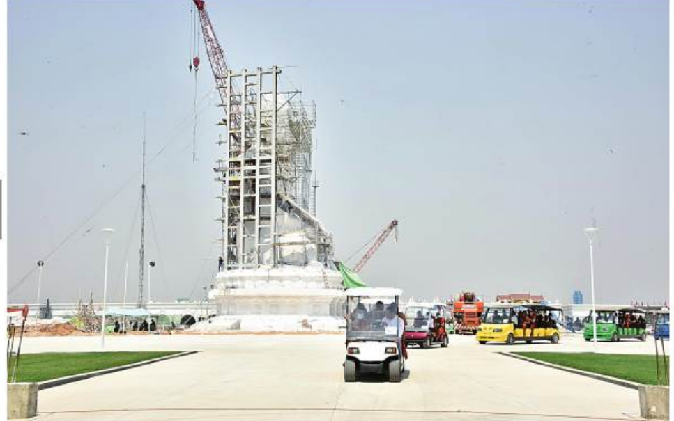
ဆရာတော်၊ သံဃာတော်ကြီးများက မာရဝိဇယဗုဒ္ဓရုပ်ပွားတော်မြတ်ကြီး တည်ဆောက်ပူဇော်နေမှုအခြေ အနေများအား လှည့်လည်လေ့လာဖူးမြော်ကြည်ညိုစဉ်။

တည်ထားကိုးကွယ်ရန် စကျင်ကျောက်တုံး တော်ကြီးများအား အဆင့်ဆင့်တူးဖော်ခြင်း နှင့် ရေလမ်းကြောင်း၊ ကုန်းလမ်းကြောင်းများ ဖြင့် ပင့်ဆောင်ခဲ့ရမှု၊ ရုပ်ပွားတော်မြတ်ကြီး ၏ ဆင်းတုတော်အပိုင်း (၁/၂/ ၃/ ၄)