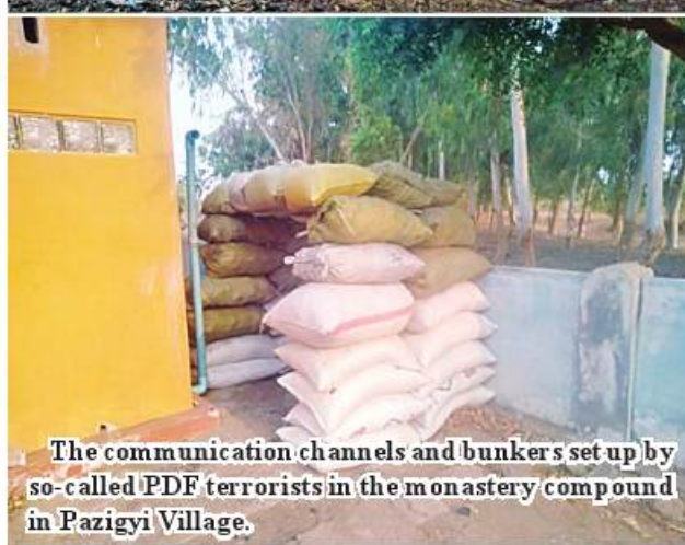
The communication channels and bunkers set up by so-called PDF terrorists in the monastery compound in Pazigyi Village.