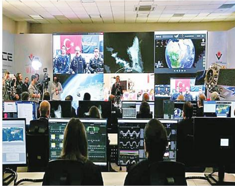
တူရကီနိုင်ငံသည် ကယ်လီဖိုးနီးယားရှိ Vandenberg အာကာသတပ်ဖွဲ့ အခြေစိုက်စခန်းမှ ၎င်း၏ ပထမဆုံးပြည်တွင်းထုတ် စူးစမ်းလေ့လာရေးဂြိုဟ်တု IMECE ကို လွှတ်တင်ခဲ့သည်။

အဆိုပါလွှတ်တင်မှုကို SpaceX က လုပ်ဆောင်ခဲ့ပြီး ဧပြီ ၁၅ ရက်တွင် တူရကီနိုင်ငံ အဆင့်မြင့်အစိုးရအရာရှိများက အွန်လိုင်းမှ ဂြိုဟ်တုအောင်မြင်စွာလွှတ်တင်မှုကို စောင့်ကြည့်နေခဲ့သည်။ တူရကီနိုင်ငံ၏ ပထမဆုံးသော ပြည်တွင်းထုတ်ဖြစ်ပြီး စူးစမ်းလေ့လာရေးဂြိုဟ်တုတွင် ကြည်လင်ပြတ်သားမှု မြင့်မားသော အရာဝတ္ထုများ၏ ပုံများကို တစ်မီတာအောက်ထိ ရိုက်ကူးနိုင်မည် ဖြစ်ကာ ကမ္ဘာမြေကို Sub-Meter Resolution ထိ စူးစမ်းကြည့်ရှုထောက်လှမ်းနိုင်မည် Electro-Optical ကင်မရာပါရှိသည်။ ဂြိုဟ်တု၏ ပတ်လမ်းသည် အမြင့် ကီလိုမီတာ ၆၈၀ (၄၂၂ ဒဿမ ၅ မိုင်)ထိ ပျံသန်းလှည့်ပတ်နိုင်မည်ဖြစ်ကြောင်း သိရသည်။