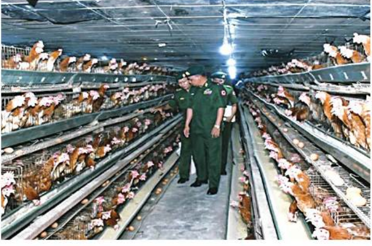
ရန်ကုန်တိုင်းစစ်ဌာနချုပ် တိုင်းမှူး ဗိုလ်ချုပ်ဇော်ဟိန်း အမှတ်(၁) စိုက်ပျိုး မွေးမြူရေးစခန်း(စော်ဘွားကြီးကုန်း)၌ ဥစားကြက်မွေးမြူရေးရုံကို ကြည့်ရှု စစ်ဆေးစဉ်။

ရေးလုပ်ငန်းများ ဝါးတန်၊ ငါးမုတ်၊ မြက်စားငါးကြင်းများ မွေးမြူ ထားရှိမှု၊ ငါးမွေးမြူရေးကန်များ၌ ငါးတန်၊ ငါးမုတ်၊ မြက်စားငါးကြင်းများ မွေးမြူထား ရှိမှု၊ ကာကီကင်း ဥစားသုံးမွေးမြူထားရှိမှု၊ ခေတ်မီဥစားကြက်များ မွေးမြူထားရှိမှု၊ အမှတ်(၁) စိုက်ပျိုးမွေးမြူရေးစခန်း (စော်ဘွားကြီးကုန်း)၌ နို့ဖိုဖျင်ဘရောင်း မိဘမျိုးဥစားကြက်များ မွေးမြူထားရှိမှု၊ ဥဖောက်စက်များလည်ပတ်နေမှု၊ အစာစပ် စက်ရုံလည်ပတ်နေမှု၊ ခေတ်မီဥစားကြက် များ မွေးမြူထားရှိမှု၊ တစ်သျှူးငှက်ပျောပင် များစိုက်ပျိုးထားရှိမှု၊ သီးပင်စားပင်များ စိုက်ပျိုးထားရှိမှုနှင့် တွံတေးမြို့နယ်ရှိ