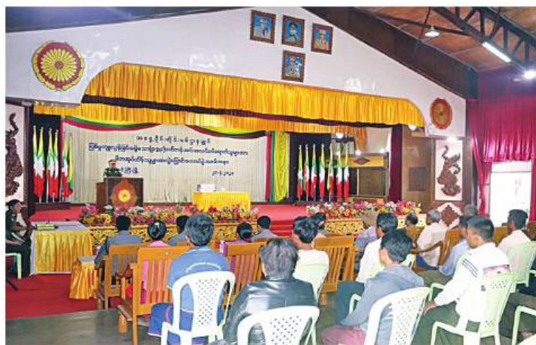
အရှေ့ပိုင်းတိုင်းစစ်ဌာနချုပ် ဒုတိယတိုင်းမှူး ဝိလ်ချပ်ကိုကိုဦး၏ ဥပဒေဘောင်အတွင်းဝင်ရောက်လာသည့် ပြစ်မှုကျူးလွန်ခြင်းမရှိခဲ့သော PDF အဖွဲ့ဝင်များအား မိဘအုပ်ထိန်းသူများထံသို့ လွှဲပြောင်းပေးအပ်ခြင်းအခမ်းအနားတွင် အမှာစကားပြောကြားစဉ်။

ဦးစွာ ဒုတိယတိုင်းမှူးက အမှာစကားပြောကြားသည်။ ထို့နောက် ဥပဒေဘောင်အတွင်းဝင်ရောက်ခဲ့သည့် ပြစ်မှုကျူးလွန်ခြင်းမရှိခဲ့သော ရှမ်းပြည်နယ် (တောင်ပိုင်း)မှ PDF အဖွဲ့ဝင် အမျိုးသား ငါးဦးနှင့် အမျိုးသမီး နှစ်ဦးကို တာဝန်ရှိသူများက ဝန်ခံကတိလက်မှတ်ရေးထိုးစေကာ ၎င်းတို့၏ မိဘအုပ်ထိန်းသူများထံသို့ လွှဲပြောင်းအပ်နှံပေးကြသည်။