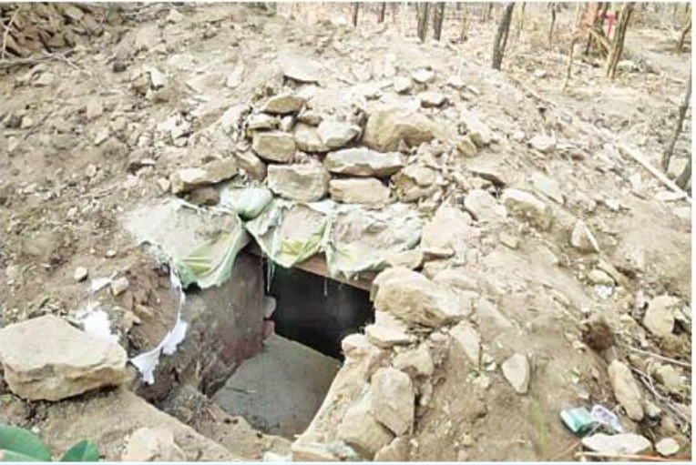
မြိုင်မြိုင်နယ် မကြီးကန်ကျေးရွာ ကျေးလက်ဆေးပေးခန်းဝင်းအတွင်း၌ PDF အမည်ခံ အကြမ်းဖက်သမားများ ခိုအောင်းနေထိုင်ခဲ့သည့်နေရာကို တွေ့ရစဉ်။

စာမျက်နှာ ၂၂ မှအဆက် နိုင်ငံ၏ဂုဏ်သိက္ခာကို များစွာကျဆင်းစေ သောလုပ်ရပ်ဖြစ်သည်။ PDF အမည်ခံ အကြမ်းဖက်သမားများ သည် ပြည်သူလူထုနှင့် တစ်မတော်က လိုလားသော ထာဝရငြိမ်းချမ်းရေးကို မျက်ကွယ်ပြုကာ ၎င်းတို့၏ကိုယ်ကျိုးကို ရှေ့တန်းတင်လုပ်ဆောင်နေသော လက်နက် ကိုင်သောင်းကျန်းသူများ၏ အထောက်အပံ့ များကိုရယူကာ လုံခြုံရေးတပ်ဖွဲ့ဝင်များနှင့် အလှမ်းကွာဝေးသော ဒေသများတွင် ဒေသခံလူထုကို အနိုင်ကျင့်ခြင်းခြောက်၍ ကျေးရွာဘုန်းကြီးကျောင်းများ၊ စာသင် ကျောင်းများ၊ ကျေးလက်ဆေးပေးခန်းနှင့်