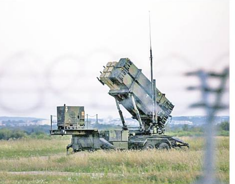
ဖြစ်သည်။ ဧပြီ ၁၆ ရက်က ယူကရိန်းတပ်ဖွဲ့ဝင်များသည် Donetsk ဒေသကိုအမြောက်များဖြင့် ပစ်ခတ်တိုက်ခိုက်ခဲ့ရာ ဩသဒေါက်စ်အီစတာပွဲတော် ကျင်းပနေစဉ် ဘုရားကျောင်းအပြင်ဘက်တွင် ဒုံးကျည်

များ ပံ့ပိုးပေးနေသောနိုင်ငံများ၏ ထိပ်သီးဆွေးနွေးပွဲကို အမေရိကန်က ဦးဆောင်ကျင်းပပေးမည်ဖြစ်သည်။ ယူကရိန်းတာဝန်ရှိသူများက ရုရှားတပ်ဖွဲ့များကို တိုက်ခိုက်ရာတွင် ကြီးမားသော တိုးတက်အောင်မြင်မှုနှင့် အချိန်ကာလသည် အနောက်နိုင်ငံမှ စစ်လက်နက်ပစ္စည်းများပေးပို့မှုအပေါ်တွင် များစွာမူတည်နေမည်ဟု ယခင်ကတည်းက ပြောကြားခဲ့သည်။ အနောက်အုပ်စုသည် ပခုံးထမ်းပစ်ခတ်နိုင်သော Stringer ဒုံးကျည်များအပါအဝင် ယူကရိန်းနိုင်ငံသို့ လေကြောင်းရန်ကာကွယ်ရေးလက်နက်စနစ်အမျိုးမျိုးကိုပေးပို့လျက်ရှိသည်။ ပိုမိုအဆင့်မြင့်သော အမေရိကန်ထုတ် Patriot စနစ်ကို ယူကရိန်းသို့ပေးအပ်ခဲ့ကြောင်း ဂျာမနီက ယခုသီတင်းပတ်တွင် ကြေညာခဲ့သည်။ ရုရှားနိုင်ငံက ယူကရိန်းကို အနောက်နိုင်ငံမှလက်နက်များအသုံးပြု၍ တိုက်ခိုက်ခဲ့သည်ဟု အကြိမ်ကြိမ်ပြောကြားထားပြီး