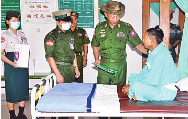
ကာကွယ်ရေးဦးစီးချုပ်ရုံး(ကြည်း)မှ ဒုတိယဗိုလ်ချုပ်ကြီးညွန့်ဝင်းဆွေ ဆေးကုသမှု ခံယူနေသူတစ်ဦးကို ရင်းရင်းနှီးနှီး မေးမြန်းအားပေးစကားပြောကြားစဉ်။

နေပြည်တော် ဧပြီ ၂၁ မွန်ပြည်နယ် ဖော်လမြိုင်မြို့ရှိ နယ်မြေခံ တပ်မတော်ဆေးရုံ၌ တက်ရောက်ဆေးကု သမှု ခံယူလျက်ရှိသော အရာရှိ၊ စစ်သည်၊ မိသားစုဝင်များနှင့် ဒေသခံပြည်သူများကို ယနေ့နံနက်ပိုင်းတွင် ကာကွယ်ရေးဦးစီးချုပ် ရုံး(ကြည်း)မှ ဒုတိယဗိုလ်ချုပ်ကြီးညွန့်ဝင်းဆွေ၊ အရှေ့တောင်တိုင်းစစ်ဌာနချုပ် တိုင်းမှူး ဗိုလ်မှူးချုပ်စိုးမင်းနှင့် အဖွဲ့ဝင်များက သွားရောက်ကြည့်ရှု၍ တစ်ဦးချင်းရောဂါ ဖြစ်ပွားမှု၊ ဆေးဝါးကုသပေးထားမှုနှင့် ကျန်းမာရေးတိုးတက်ကောင်းမွန်မှု အခြေ အနေများကို ရင်းရင်းနှီးနှီးမေးမြန်းအားပေး စကားပြောကြားပြီး စားသောက်ဖွယ်ရာ