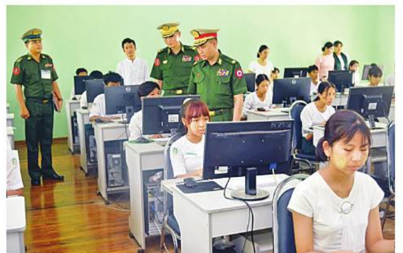
နေပြည်တော်တိုင်းစစ်ဌာနချုပ် တိုင်းမှူး ဝိလ်ချပ်ကိုကိုဦး ဝိလ်ချပ်ကိုကိုဦးနှင့်အဖွဲ့ဝင်များက ပုဗ္ဗသီရိတပ်နယ် အမှတ်(၂) အခြေခံပညာအထက်တန်းကျောင်းတွင် ဖွင့်လှစ်ထားရှိသော အင်္ဂလိပ်စာအခြေခံသင်တန်းသို့ တက်ရောက်နေသည့် သင်တန်းသား၊ သင်တန်းသူများကို ကြည့်ရှုအားပေးစဉ်။

နေပြည်တော် ဧပြီ ၂၁ အသီးသီးတွင် ဖွင့်လှစ်သင်ကြား နေပြည်တော်တိုင်း စစ်ဌာနချုပ်ရှိ လျက်ရှိသည်။ ယနေ့နံနက်ပိုင်းတွင် နေပြည်တော်တိုင်းစစ်ဌာနချုပ် တိုင်းမှူး ဝိလ်ချပ်ကိုကိုဦးနှင့်အဖွဲ့ဝင်များက ပုဗ္ဗသီရိတပ်နယ် အမှတ်(၃) အခြေခံပညာအထက်တန်းကျောင်းနှင့် လေယာဉ်တပ်နယ် အမှတ်(၂) အခြေခံပညာအထက်တန်းကျောင်းတို့တွင် ဖွင့်လှစ်ထားရှိသည့် ကွန်ပျူတာ အခြေခံသင်တန်းများသို့ သွားရောက်ကြည့်ရှုအားပေးပြီး တာဝန်ရှိသူများနှင့်တွေ့ဆုံကာ လိုအပ်သည်များ ညှိနှိုင်းဖြည့်ဆည်းဆောင်ရွက်ပေးသည်။ နေပြည်တော်တိုင်း စစ်ဌာနချုပ်ကွပ်ကဲမှုအောက် တပ်နယ်အသီးသီးတွင် ယဉ်ကျေးလိမ္မာသင်တန်း သင်တန်းသား၊ သင်တန်းသူ ၂၀၆၈ ဦး၊ အင်္ဂလိပ်စာအခြေခံသင်တန်း သင်တန်းသား၊ သင်တန်းသူ ဦးရေ ၁၇၅၀ နှင့် ကွန်ပျူတာအခြေခံသင်တန်း သင်တန်းသား၊ သင်တန်းသူ ၆၉၁ ဦးတို့ကို ဧပြီ ၁၈ ရက်မှ ၂၈ ရက်ထိ ဖွင့်လှစ်သင်ကြားပေးသွားမည် ဖြစ်ကြောင်း သတင်းရရှိသည်။