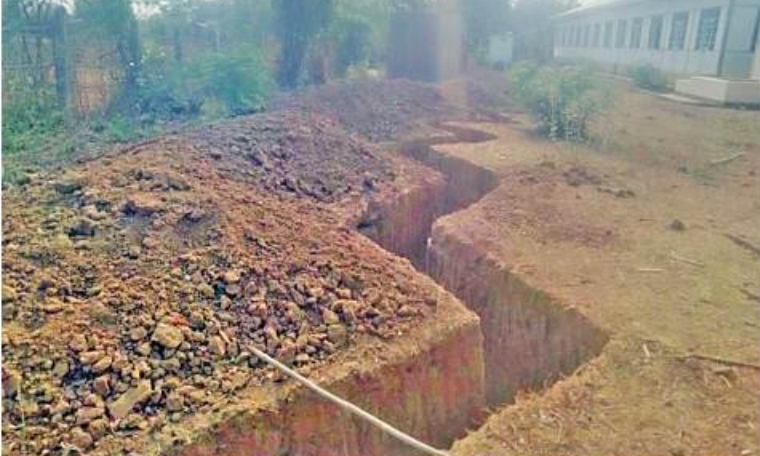
PDF အမည်ခံ အကြမ်းပက်သမားများက ပရိကြီးရွာ ဘုန်းတော်ကြီးကျောင်းဝင်း အတွင်း ဆက်သွယ်ရေးမြောင်းများနှင့် ပစ်ကျင်းများ ပြုလုပ်ထားရှိမှုကို တွေ့ရစဉ်။

အဆိုပါကျေးရွာ အနီးတစ်ဝိုက်ကို လုံခြုံရေးတပ်ဖွဲ့ဝင်များက အသေးစိတ် ရှာဖွေစစ်ဆေးခဲ့ရာ ဘုန်းကြီးကျောင်း ကြောင်း ဒေသခံများကပင် သတင်းပေးပို့ အုတ်တံတိုင်းအနီးမှ အကြမ်းပက်သမား အလောင်း လေးလောင်း၊ ကျည်အိမ်နှစ်ခု၊ ၄၀ မမ ဝဲသီးငါးလုံး၊ သဲအိတ်ဘန်ကာများ၊ ကျောင်းခြံစည်းရိုးအနီး ဆက်သွယ်ရေး မြောင်းနှင့် ပစ်ကျင်းများ အကြမ်းပက်သမား များအသုံးပြုခဲ့သည် ဆိုင်ကယ်ခုနစ်စီး၊ လူနေတဲများ၊ ၁၂ ဝိုက်ကျည် ၁၀ တောင့်၊ မိုင်းရှာစက်တစ်လုံး၊ ဘက်ထရီအိုးအကြီး သုံးလုံး၊ ပြောက်ကျားယူနီဖောင်းများနှင့် အခြားဆက်စပ်ပစ္စည်းများ သိမ်းဆည်း ရမိခဲ့သည်။