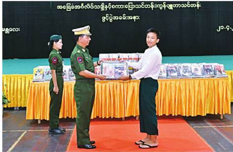
အခြေခံအင်္ဂလိပ်သဒ္ဒါနှင့်စကားပြောသင်တန်း၊ ကွန်ပျူတာသင်တန်း ဖွင့်ပွဲအခမ်းအနား