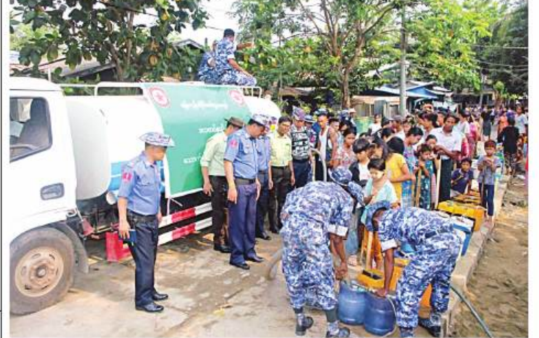
ရန်ကုန်တိုင်းဒေသကြီး ဒလမြို့နယ်အတွင်းရှိ ရပ်ကွက်များသို့ ရန်ကုန်တိုင်းစစ်ဌာနချုပ်ကွပ်ကဲမှုအောက် ဒလတပ်နယ်မှ နယ်မြေခံရရှိသည့် စခန်းဌာနချုပ်မှ ရေသယ်ရေယာဉ်များက သောက်သုံးရေများ ဖြန့်ဝေလှူဒါန်းစဉ်။

နေပြည်တော် ဧပြီ ၂၁ ရန်ကုန်တိုင်းဒေသကြီး ဒလမြို့နယ်အတွင်းရှိ သောက်သုံးရေရရှိရေးအတွက် နေရာမရသည့် မှော်စက်ရပ်ကွက်ရှိ အိမ်ထောင်စု ၂၄၆၀ စု၊ ကမာကဆစ်ရပ်ကွက်ရှိ အိမ်ထောင်စု ၂၉၇၇ စုနှင့် ဗညားဒလ ရပ်ကွက် နန်းဦးပရိယတ္တိစာသင်တိုက်တွင် သီတင်းသုံးနေထိုင်တော်မူသော သံဃာတော် အပါး ၁၅၀ တို့အတွက် သောက်သုံးရေအဆင်ပြေစေရေးအတွက် ယနေ့နံနက်ပိုင်းတွင် ရန်ကုန်တိုင်းစစ်ဌာနချုပ် ကွပ်ကဲမှုအောက် ဒလတပ်နယ်မှ နယ်မြေခံရရှိသည့် စခန်းဌာနချုပ်မှ ရေသယ်ရေယာဉ် ၁၀ စီးဖြင့် သောက်သုံးရေစုစုပေါင်း ဂါလန် ၃၇၅၀၀ ကို သွားရောက်ဖြန့်ဝေလှူဒါန်းပေးခဲ့သည်။ ထိုသို့ ဆောင်ရွက်ပေးနေမှုများကို တိုင်းစစ်ဌာနချုပ် ကွပ်ကဲမှုအောက် ဒလတပ်နယ်မှ တာဝန်ရှိသူများက သွားရောက်ကြည့်ရှုအားပေးပြီး နန်းဦးပရိယတ္တိစာသင်တိုက်သို့ လှူဖွယ်ဝတ္ထုပစ္စည်းများလှူဒါန်းခဲ့ကြောင်း သတင်းရရှိသည်။