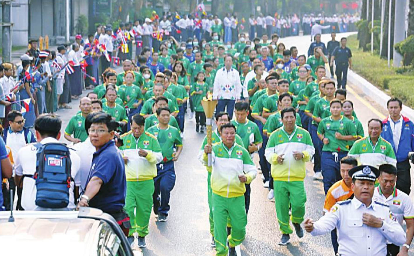
(၃၂)ကြိမ်မြောက် အရှေ့တောင်အာရှအားကစားပြိုင်ပွဲနှင့် (၁၂)ကြိမ်မြောက် အာဆီယံမသန်စွမ်းသူများအားကစားပြိုင်ပွဲအထိမ်းအမှတ် မီးရှူးတိုင်သယ်ယူခြင်းအခမ်းအနား ကျင်းပစဉ်။

ရန်ကုန် ဧပြီ ၂၁ တောင်အာရှအားကစားပြိုင်ပွဲနှင့် ၉ ရက်မှ ၉ မီးရှူးတိုင်လက်ဆင့်ကမ်းသယ်ယူခြင်းအခမ်းအနား ကမ္ဘောဒီးယားနိုင်ငံတွင် မေ ၅ ရက်မှ ၁၇ ရက်ထိ ကျင်းပမည့် (၁၂)ကြိမ်မြောက် အာဆီယံ ကို ယနေ့နံနက် ၇ နာရီတွင် ရန်ကုန်တိုင်းဒေသကြီး ရက်ထိ ကျင်းပမည့် (၃၂)ကြိမ်မြောက် အရှေ့ မသန်စွမ်းသူများ အားကစားပြိုင်ပွဲအထိမ်းအမှတ် စာမျက်နှာ ၁၈ ကော်လံ ၁ ☆