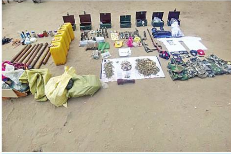
မြိုင်မြိုင်နယ် မကြီးကန်ကျေးရွာ ကျေးလက်ဆေးပေးခန်း၌ လက်နက်၊ ခဲယမ်းနှင့် ဆက်စပ်ပစ္စည်းများ သိမ်းဆည်းရရှိသည့် မှတ်တမ်းဓာတ်ပုံ။

လူနေအိမ်များတွင် သဲအိတ်၊ ဘန်ကာများ ဆောက်လုပ်ခြင်း၊ ပစ်ကျင်းများတူးခြင်း၊ ပတ်ဝန်းကျင်တွင် လက်လုပ်ပိုင်းအတား အဆီးများ ထောင်ထားခြင်းများ ပြုလုပ်လာ ခဲ့သည်။ ထို့ပြင် အကြမ်းဖက်လုပ်ရပ်များ လုပ်ဆောင်ရာ၌ ဘုရားကျောင်းကန်၊ ရဟန်းသံဃာနှင့် သီလရှင်များအပေါ်တွင် လည်း ရက်စက်ယုတ်မာမှုများ လုပ်ဆောင် လာခဲ့ပြီး ဗုဒ္ဓဘာသာဝင်တို့ အထွတ်အမြတ် ထားရာ သင်္ကန်းကိုအသုံးပြု၍ အကြမ်း ဖက်မှုလုပ်ရပ်များကိုလည်း စက်ဆုပ်ရွံရှာ ဖွယ်ပြုလုပ်လာကြောင်း တွေ့ရှိရသည်။ အဆိုပါ အများနှင့်သက်ဆိုင်သော စစ်ဘက်နှင့်မသက်ဆိုင်သည့် အဆောက် အအုံနေရာများကို အသုံးပြုခြင်း၊ ပြည်သူ