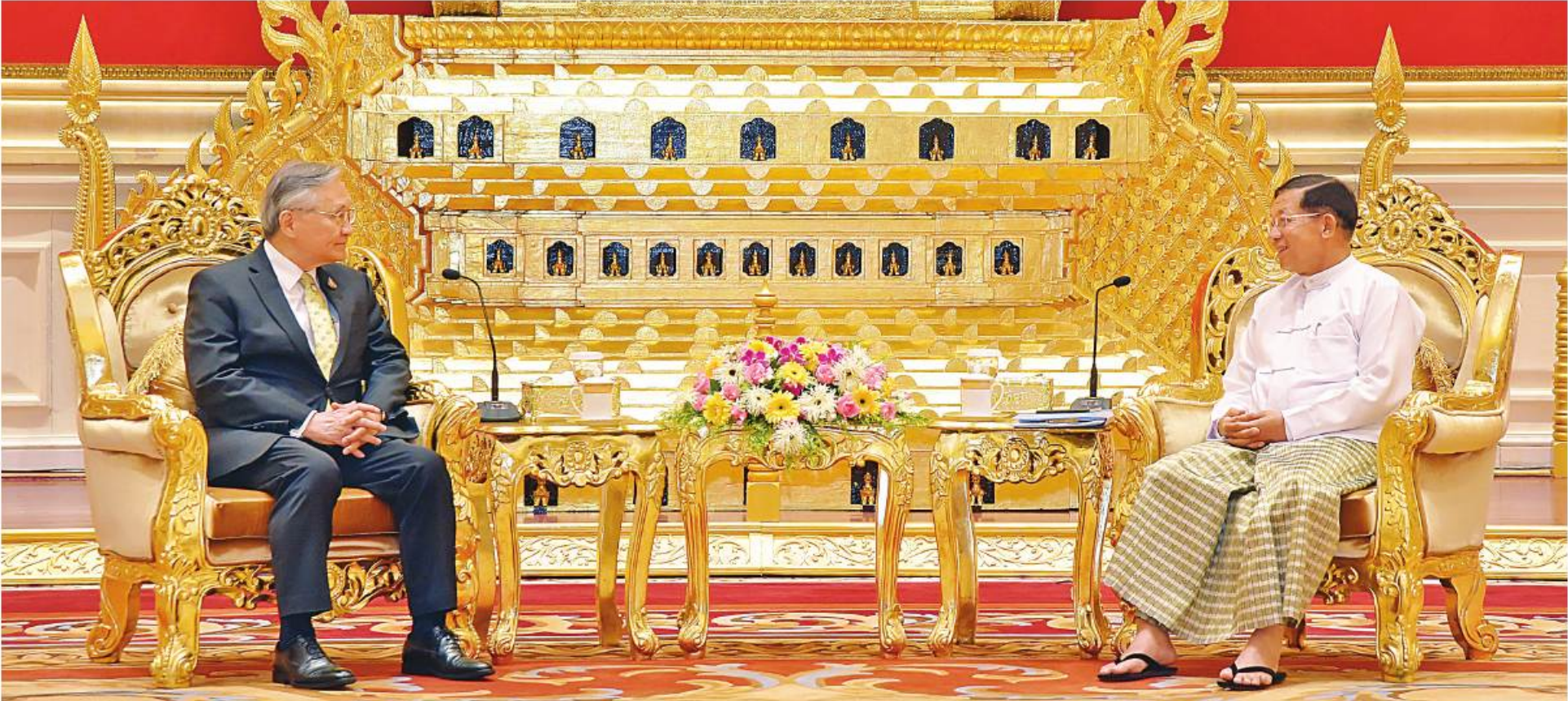
နိုင်ငံတော်စီမံအုပ်ချုပ်ရေးကောင်စီဥက္ကဋ္ဌ နိုင်ငံတော်ဝန်ကြီးချုပ် ပိုလ်ချုပ်မှူးကြီးမင်းအောင်လှိုင် ထိုင်းနိုင်ငံ ဒုတိယဝန်ကြီးချုပ်နှင့်နိုင်ငံခြားရေးဝန်ကြီး H.E. Mr. Don Pramudwinai ဦးဆောင်သည့် ကိုယ်စားလှယ်အဖွဲ့ကို လက်ခံတွေ့ဆုံစဉ်။

နေပြည်တော် ဧပြီ ၂၁ မင်းအောင်လှိုင်သည် ထိုင်းနိုင်ငံ ဒုတိယဝန်ကြီးချုပ် အဖွဲ့ကို ယနေ့မွန်းလွဲပိုင်းတွင် နေပြည်တော်ရှိ ထိုင်းအစိုးရအဖွဲ့နှင့် တွေ့ဆုံရက်စွဲအတွက် မြန်မာနိုင်ငံ၊ ထိုင်းနိုင်ငံ နိုင်ငံတော်စီမံအုပ်ချုပ်ရေးကောင်စီ ဥက္ကဋ္ဌနှင့် နိုင်ငံခြားရေးဝန်ကြီး H.E. Mr. Don Pramudwinai ဦးဆောင်သည့် ကိုယ်စားလှယ် အဖွဲ့ကို လက်ခံတွေ့ဆုံသည်။ နိုင်ငံတော်ဝန်ကြီးချုပ် ပိုလ်ချုပ်မှူးကြီး H.E. Mr. Don Pramudwinai ဦးဆောင်သည့် ကိုယ်စားလှယ် အဖွဲ့သည် မင်းအောင်လှိုင်နှင့်အတူ တွေ့ဆုံရက်စွဲအတွက် မြန်မာနိုင်ငံ၊ ထိုင်းနိုင်ငံ နိုင်ငံတော်စီမံအုပ်ချုပ်ရေးကောင်စီ ဥက္ကဋ္ဌနှင့် နိုင်ငံခြားရေးဝန်ကြီး H.E. Mr. Don Pramudwinai ဦးဆောင်သည့် ကိုယ်စားလှယ် အဖွဲ့ကို လက်ခံတွေ့ဆုံသည်။