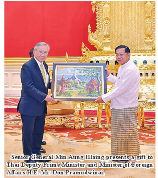
Senior General Min Aung Hlaing presents a gift to Thai Deputy Prime Minister and Minister of Foreign Affairs H.E. Mr. Don Pramudwinai.

Lt-Gen Ye Win Oo, Union Minister for Foreign Affairs U Than Swe, Union Minister for International Cooperation U Ko Ko Hlaing and officials. The Thai Deputy Prime Minister was accompanied by Thai Ambassador to Myanmar H.E. Mr. Mongkol Visittump and officials. 100