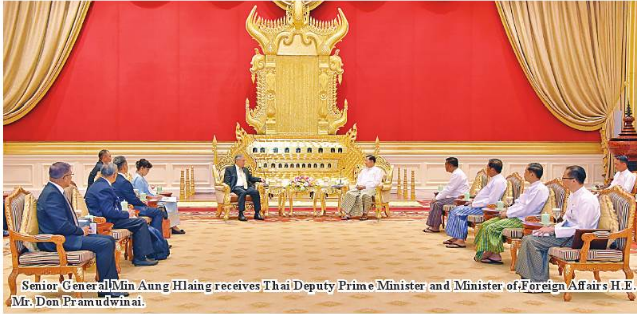
Senior General Min Aung Hlaing receives Thai Deputy Prime Minister and Minister of Foreign Affairs H.E. Mr. Don Pramudwinai.

Nay Pyi Taw April 21 Chairman of the State Administration Council Prime Minister Senior General Min Aung Hlaing received a delegation led by Deputy Prime Minister and Minister of Foreign Affairs