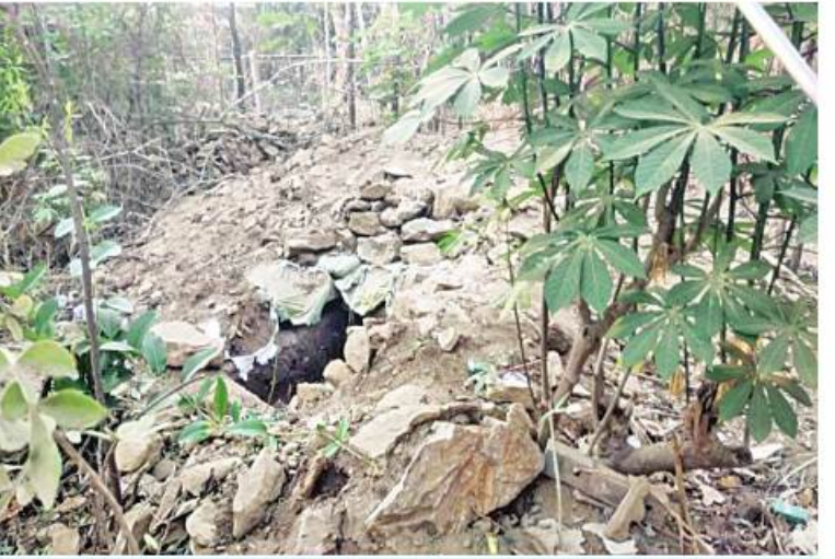
မြိုင်မြိုင်နယ် မကြီးကန်ကျေးရွာ ကျေးလက်ဆေးပေးခန်းဝင်းအတွင်း၌ PDF အမည်ခံ အကြမ်းဖက်သမားများ ခိုအောင်းနေထိုင်ခဲ့သည့်နေရာကို တွေ့ရစဉ်။