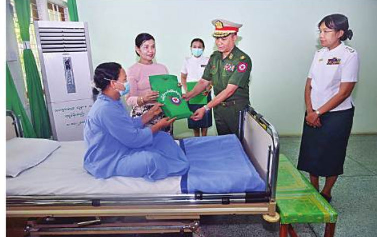
နေပြည်တော်တိုင်းစစ်ဌာနချုပ် တိုင်းမှူး ဗိုလ်မှူးချုပ်ဝေလင်း ဆေးကုသမှု ခံယူနေသူတစ်ဦးကို စားသောက်ဖွယ်ရာများ ပေးအပ်စဉ်။

နေပြည်တော် ဧပြီ ၂၁ မွန်ပြည်နယ် ဖော်လမြိုင်မြို့ရှိ နယ်မြေခံ တပ်မတော်ဆေးရုံ၌ တက်ရောက်ဆေးကု သမှု ခံယူလျက်ရှိသော အရာရှိ၊ စစ်သည်၊ မိသားစုဝင်များနှင့် ဒေသခံပြည်သူများကို ယနေ့နံနက်ပိုင်းတွင် ကာကွယ်ရေးဦးစီးချုပ် ရုံး(ကြည်း)မှ ဒုတိယဗိုလ်ချုပ်ကြီးညွန့်ဝင်းဆွေ၊ အရှေ့တောင်တိုင်းစစ်ဌာနချုပ် တိုင်းမှူး ဗိုလ်မှူးချုပ်စိုးမင်းနှင့် အဖွဲ့ဝင်များက သွားရောက်ကြည့်ရှု၍ တစ်ဦးချင်းရောဂါ ဖြစ်ပွားမှု၊ ဆေးဝါးကုသပေးထားမှုနှင့် ကျန်းမာရေးတိုးတက်ကောင်းမွန်မှု အခြေ အနေများကို ရင်းရင်းနှီးနှီးမေးမြန်းအားပေး စကားပြောကြားပြီး စားသောက်ဖွယ်ရာ