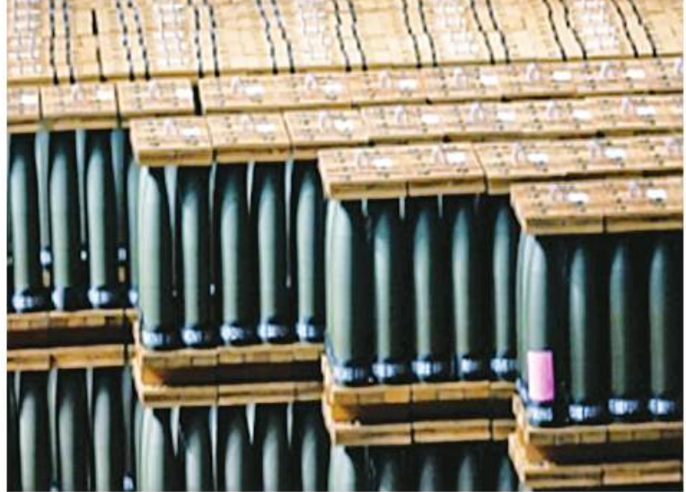
ပင်တဂန်စစ်ဌာနချုပ်သည် ယူကရိန်းနိုင်ငံအတွက် အမေရိကန်ဒေါ်လာ ၃၂၅ သန်းတန်ဖိုးရှိ စစ်လက်နက်အကူအညီပေး

ရေးပက်ကျေချ်အသစ် ပေးအပ်သွားမည် ဖြစ်ကြောင်း အမေရိကန်နိုင်ငံ ကာကွယ်ရေးဝန်ကြီးဌာနက ဧပြီ ၁၈ ရက်တွင်