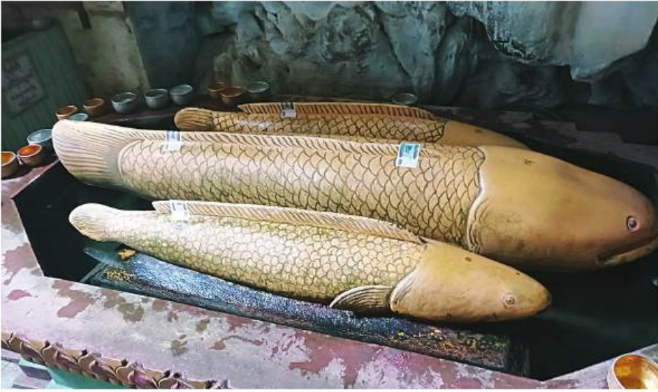
ရန်ကင်းတောင်ရှိ ငါးရုံမင်းရပ်တုကို တွေ့ရစဉ်။

ရန်ကင်းတောင်ကို ပါဠိဘာသာစကားနဲ့ အဘယဂီရိ တောင်လို့လဲ ခေါ်ဆိုကြပါတယ်။ အဘယဆိုတာ ဘေး အန္တရာယ်ကင်းရှင်းတာဖြစ်ပြီး ဂီရိက တောင်လို့ အဓိပ္ပာယ်ရနေတယ်။ ရန်ကင်းတောင်က အမြင့်ပေ ၆၀၄ ပေမြင့်နေပြီး အလျား ၆၆၀၆ ပေရှိပါတယ်။