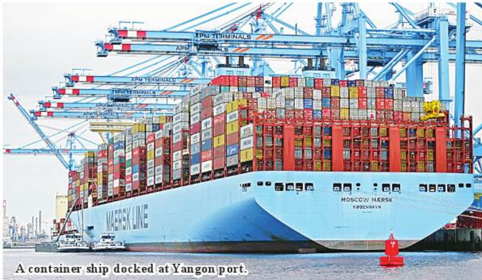
A container ship docked at Yangon port.

conditions, the arrival of large international commercial ships at Yangon international ports has also increased.