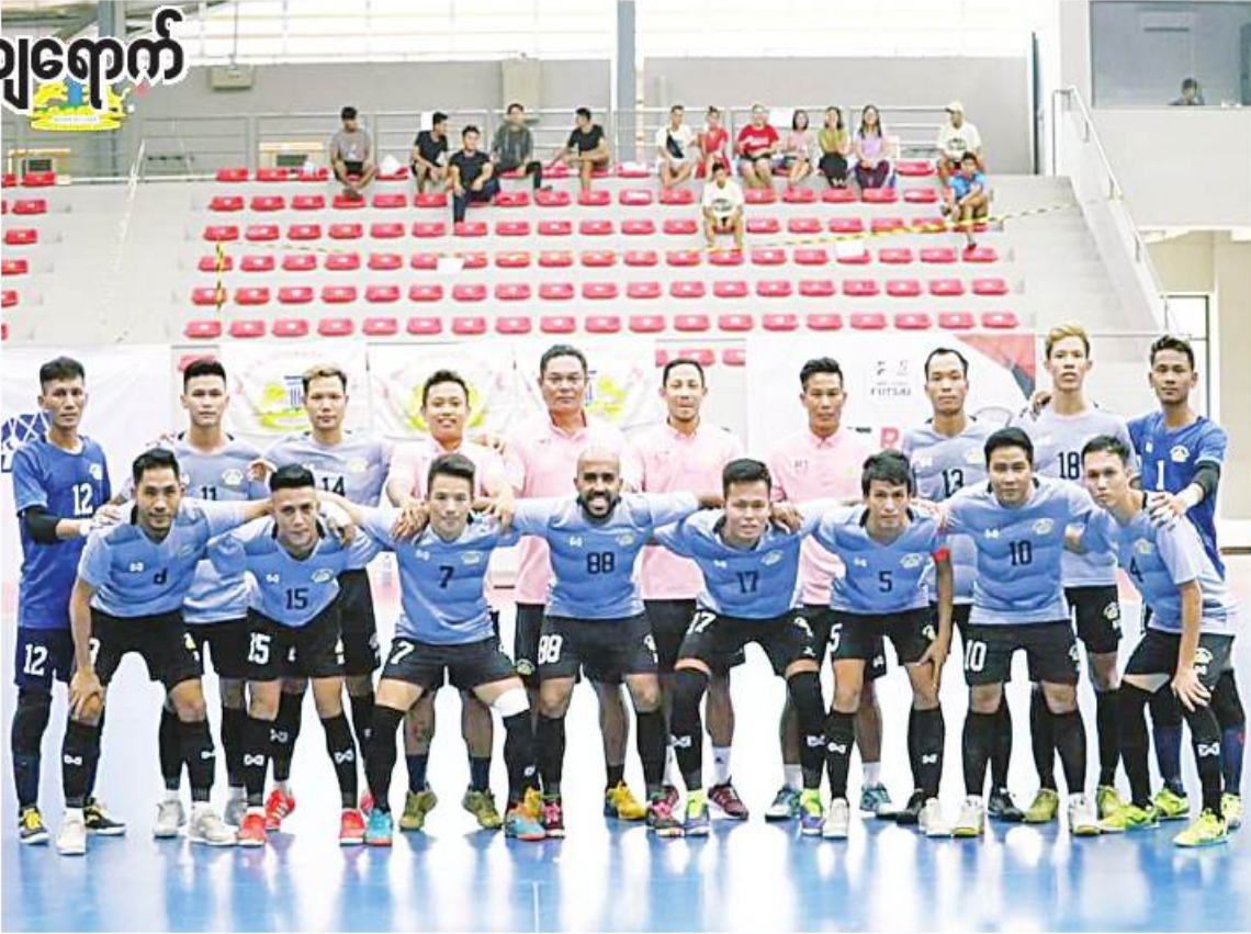
အာဆီယံဖူဆယ်ကလပ် ချန်ပီယံရှစ်ပြိုင်ပွဲ ဝင်ရောက်ယှဉ်ပြိုင်မည့် VUC အသင်းကို တွေ့ရစဉ်။

ရန်ကုန် ဧပြီ ၂၀ အာဆီယံ ဘောလုံးအဖွဲ့ချုပ်က ကြီးမှူးကျင်းပမည့် အာဆီယံဖူဆယ်ကလပ်ချန်ပီယံရှစ်ပြိုင်ပွဲအတွက် အုပ်စုပွဲစဉ်များမဲခွဲမှုအပြီးတွင် မြန်မာနိုင်ငံကိုယ်စားပြု ဝင်ရောက်ယှဉ်ပြိုင်မည့် VUC အသင်းသည် အုပ်စု(က)တွင် ကျရောက်ခဲ့ကြောင်း သိရသည်။ VUC အသင်းသည် ပြီးခဲ့သည့် ၂၀၂၂ မြန်မာဖူဆယ်လိဂ်ပြိုင်ပွဲတွင် ချန်ပီယံဆု ဆွတ်ခူးနိုင်ခဲ့သည့်အတွက် ထိုင်းနိုင်ငံက အိမ်ရှင်အဖြစ် လက်ခံကျင်းပမည့် အာဆီယံဖူဆယ်ကလပ်ချန်ပီယံရှစ်ပြိုင်ပွဲသို့ ဝင်ရောက်ယှဉ်ပြိုင်ခွင့်ရရှိခဲ့ခြင်းဖြစ်သည်။ အာဆီယံဖူဆယ်ကလပ်ချန်ပီယံရှစ်ပြိုင်ပွဲအတွက် အုပ်စုမဲခွဲမှုအပြီးတွင် စာမျက်နှာ ၁၈ ကော်လံ ၄ ☆