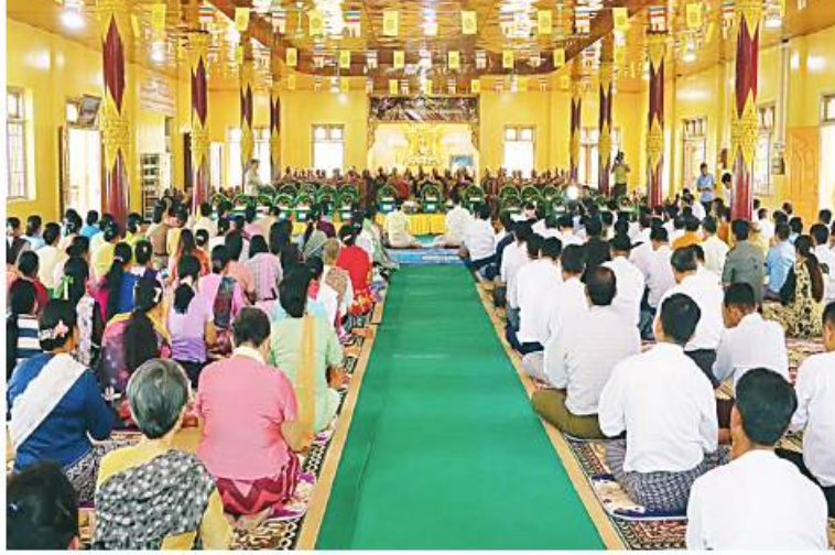
အရှေ့မြောက်တိုင်းစစ်ဌာနချုပ်၏ အဋ္ဌာရသမကြိမ်မြောက် စုပေါင်းရဟန်းခံ၊ ရှင်ပြု၊ အလှူတော်မင်္ဂလာပြုလုပ်စဉ်။

အဆိုပါ ရဟန်းခံ၊ ရှင်ပြုအလှူတော်မင်္ဂလာတွင် တိုင်းစစ်ဌာနချုပ်နှင့် လားရှိုးတပ်နယ်မှ အရာရှိ၊ စစ်သည်၊ မိသားစုဝင်များ၊ စစ်မှုထမ်းဟောင်းအဖွဲ့ဝင်များ စုစုပေါင်း ၁၄၅ ပါးတို့ကို သာသနာ့ဘောင်အတွင်းသို့ သွတ်သွင်းပေးနိုင်ခဲ့ကြောင်း သတင်းရရှိသည်။