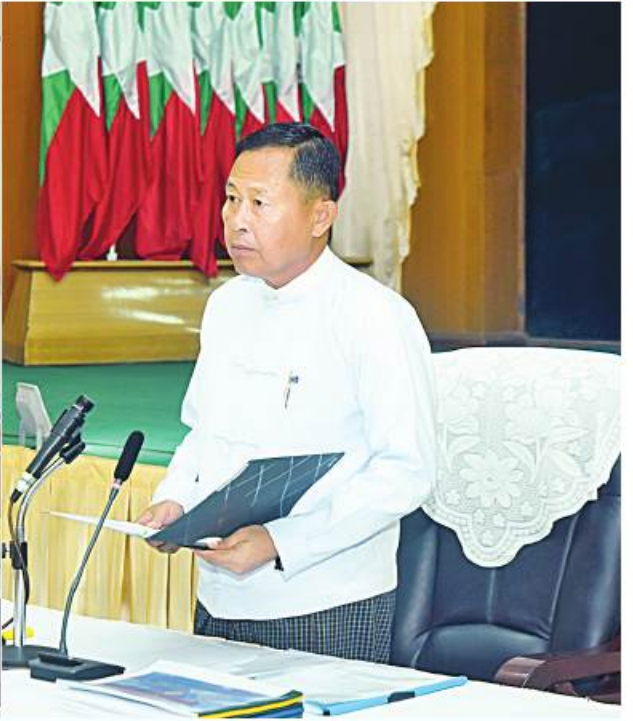
ပြည်ထောင်စုသမ္မတမြန်မာနိုင်ငံတော် နိုင်ငံတော်စီမံအုပ်ချုပ်ရေးကောင်စီ ကဆုန်လပြည့်(ဗုဒ္ဓနေ့)ဆိုင်ရာ မဟာမင်္ဂလာအခမ်းအနားများကျင်းပရေးနာယကအဖွဲ့ဥက္ကဋ္ဌ နိုင်ငံတော်စီမံအုပ်ချုပ်ရေးကောင်စီ ဒုတိယဥက္ကဋ္ဌ ဒုတိယဝန်ကြီးချုပ် ဒုတိယဗိုလ်ချုပ်မှူးကြီးစိုးဝင်း၊ ကဆုန်လပြည့်(ဗုဒ္ဓနေ့)ဆိုင်ရာ မဟာမင်္ဂလာအခမ်းအနားများကျင်းပရေးနာယကအဖွဲ့နှင့် ဦးစီးကော်မတီလုပ်ငန်းညှိနှိုင်းအစည်းအဝေးတွင် အမှာစကားပြောကြားစဉ်။

နေပြည်တော် ဧပြီ ၂၀ ကဆုန်လပြည့်(ဗုဒ္ဓနေ့)ဆိုင်ရာ မဟာမင်္ဂလာအခမ်းအနားများ ကျင်းပရေးနာယကအဖွဲ့နှင့် ဦးစီးကော်မတီလုပ်ငန်းညှိနှိုင်းအစည်းအဝေးကို ယနေ့မုန်းလွဲ ၂ နာရီတွင် နေပြည်တော်ရှိ သာသနာရေးနှင့်ယဉ်ကျေးမှုဝန်ကြီးဌာန အစည်းအဝေးခန်းမ၌ကျင်းပရာ ပြည်ထောင်စုသမ္မတမြန်မာနိုင်ငံတော် နိုင်ငံတော်စီမံအုပ်ချုပ်ရေးကောင်စီ ကဆုန်လပြည့်(ဗုဒ္ဓနေ့)ဆိုင်ရာ မဟာမင်္ဂလာအခမ်းအနားများကျင်းပရေးနာယကအဖွဲ့ဥက္ကဋ္ဌ နိုင်ငံတော်စီမံအုပ်ချုပ်ရေးကောင်စီ ဒုတိယဥက္ကဋ္ဌ ဒုတိယဝန်ကြီးချုပ် ဒုတိယဗိုလ်ချုပ်မှူးကြီးစိုးဝင်း တက်ရောက်အမှာစကားပြောကြားသည်။ အစည်းအဝေးသို့ ပြည်ထောင်စုဝန်ကြီးများ၊ နေပြည်တော်ကောင်စီဥက္ကဋ္ဌ၊ နေပြည်တော်တိုင်းစစ်ဌာနချုပ်တိုင်းမှူး၊ ဒုတိယဝန်ကြီးများ၊ အမြဲတမ်းအတွင်းဝန်များ၊ ညွှန်ကြားရေးမှူးချုပ်များနှင့် တာဝန်ရှိသူများ တက်ရောက်ကြသည်။ ဦးစွာ အစည်းအဝေးကို နမောတသသုံးကြိမ်ရွတ်ဆို ဘုရားကန်တော်၌ ဖွင့်လှစ်သည်။ အစည်းအဝေးတွင် နိုင်ငံတော်စီမံအုပ်ချုပ်ရေးကောင်စီ ဒုတိယဥက္ကဋ္ဌ ဒုတိယဝန်ကြီးချုပ်က စာမျက်နှာ ၁၆ ကော်လံ ၁၉