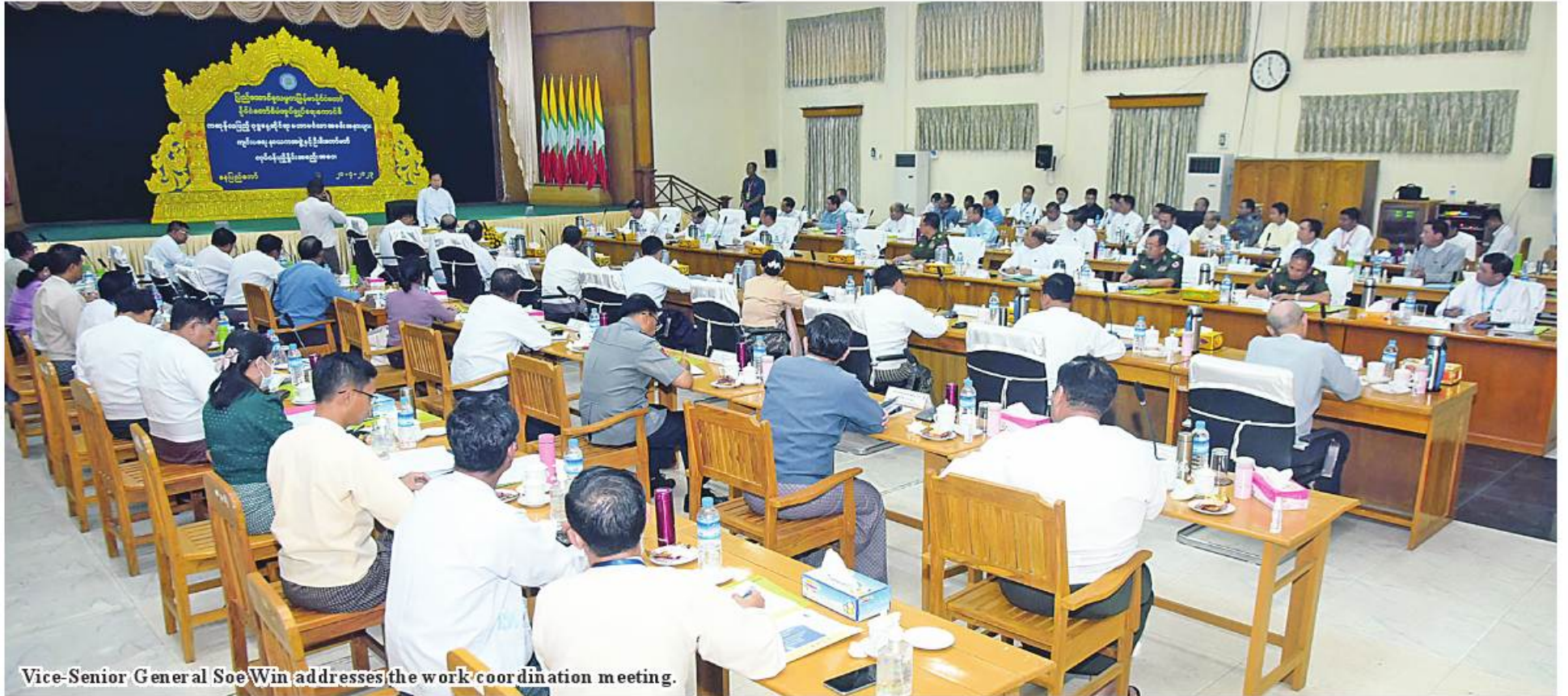
Vice-Senior General Soe Win addresses the work coordination meeting.