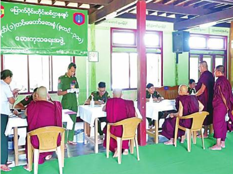
သံဃာတော်များအား မြောက်ပိုင်းတိုင်းစစ်ဌာနချုပ် နယ်မြေခံဆေးကုသရေးအဖွဲ့က ကျန်းမာရေးစောင့်ရှောက်မှုလုပ်ငန်းများ ဆောင်ရွက်ပေးစဉ်။

ကချင်ပြည်နယ် မြစ်ကြီးနားမြို့ပေါ်ရှိ သံဃာတော်များအား မြောက်ပိုင်းတိုင်း စစ်ဌာနချုပ် နယ်မြေခံဆေးကုသရေးအဖွဲ့က ယနေ့တွင် ဝေယျမင်္ဂလာဘုန်းတော်ကြီးကျောင်းဝင်းအတွင်း၌ ကျန်းမာရေးစောင့်ရှောက်မှုလုပ်ငန်းများ ဆောင်ရွက်ပေးသည်။