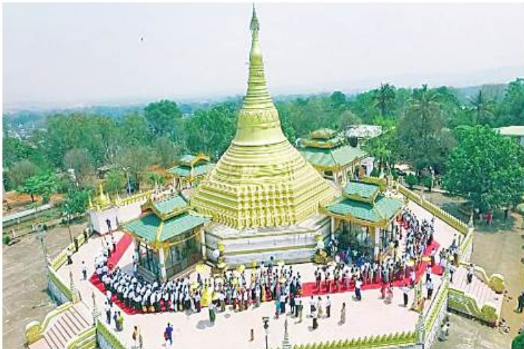
အရှေ့မြောက်တိုင်းစစ်ဌာနချုပ်၏ အဋ္ဌာရသမကြိမ်မြောက် စုပေါင်းရဟန်းခံ၊ ရှင်ပြု၊ အလှူတော်မင်္ဂလာပြုလုပ်စဉ်။