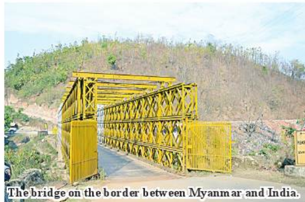
The bridge on the border between Myanmar and India.