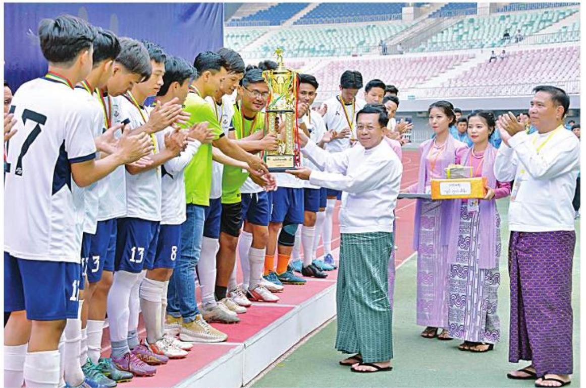
နိုင်ငံတော်စီမံအုပ်ချုပ်ရေးကောင်စီဥက္ကဋ္ဌ နိုင်ငံတော်ဝန်ကြီးချုပ် ဝိုင်းလှည့်မှုကြီးမင်းအောင်လှိုင် ပထမဆုရရှိသည့် နည်းပညာ တက္ကသိုလ်(အထက်မြန်မာပြည်) (က)အသင်းအား ဂုဏ်ပြုချီးမြှင့်ငွေနှင့် တံခွန်စိုက်ဖလားတို့ကို ပေးအပ်ချီးမြှင့်စဉ်။

အသင်းကို ကောင်စီဝင် ဒေါ်ခွဲဘူကလည်း ကောင်း၊ ဒုတိယဆုရရှိသည့် ကွန်ပျူတာ တက္ကသိုလ် (အောက်မြန်မာပြည်) (က) အသင်းကို ကောင်စီဝင် ဝိုင်းလှည့်မှုကြီး တင်အောင်စန်းကလည်းကောင်း တစ်ဦး ချင်းဆုတံဆိပ်၊ ဂုဏ်ပြုဆုနှင့်ချီးမြှင့်ငွေများ ကို ပေးအပ်ချီးမြှင့်ကြသည်။