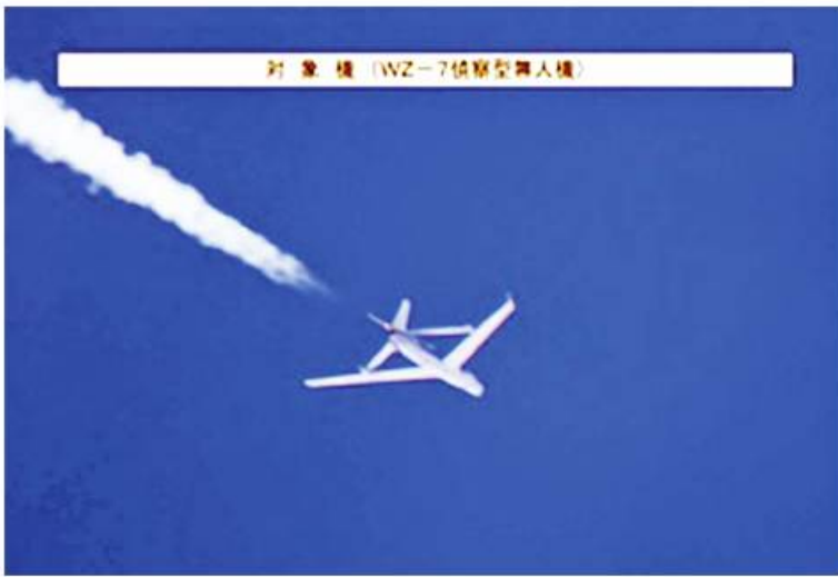
ဒရုန်းအသစ်တွင် တပ်ဆင်ထားသည့် ရေဒါနှင့်အီလက်ထရွန်နစ် အထောက်အကူ ပြုစနစ်များသည် PLA ရေတပ်၏ ရှာဖွေထောက်လှမ်းရေး၊ စောင့်ကြည့်ထောက်လှမ်းရေးနှင့် ကင်းထောက်ခြင်းကွန်ရက်ကိုဖြည့်ဆည်းပေးနိုင်မည်လည်းဖြစ်သည်။ CHINA UNVEILS NAVAL VARIANT OF WZ-7 RECONNAISSANCE DRONE ကို ဘာသာပြန်ဆိုထားပါသည်။

MQ-4C TRITON ထောက်လှမ်းရေး ဒရုန်းနှင့်ဆင်တူလှနီးပါးဖြစ်သည်။ ၎င်းတို့၏ ရေဒါများသည် ကွဲပြားကြသည်။ MQ-4C TRITON တွင် မြေပြင်ဆီသို့အတားအဆီးမရှိ ငုံ့ ကြည့်နိုင်သော LINE OF SIGHT အတိုင်းထောက်လှမ်းနိုင်သည့်ညွှန်းရပ် ၃၆၀ ဒီဂရီပတ်လည် ရေဒါပါရှိပြီး WZ-7 ကင်းထောက်ဒရုန်းမျိုးကွဲသစ်တွင် ရွေ့မျက်နှာစာတည်တည် ထောက်လှမ်းနိုင်သော ရေဒါတစ်ခုသာ ပါရှိသည်။ တရုတ်နိုင်ငံထုတ် WZ-7 ကင်းထောက် ဒရုန်းသည် ပင်လယ်ရေကြောင်း ရေတပ်စွမ်းအားစုများဖြစ်သည့် တိုက်ယာဉ်များ၏ ဆက်သွယ်ရေးနှင့် ရေဒါစွမ်းဆောင်ရည်များကိုကျဆင်းစေရန် ဒီဇိုင်းထုတ်ထားသည့် STAND-OFF JAMMER တစ်ခုလည်းဖြစ်လာနိုင်ဖွယ်ရှိသည်ဟု သံသယ ဖြစ်စေနိုင်သည်။