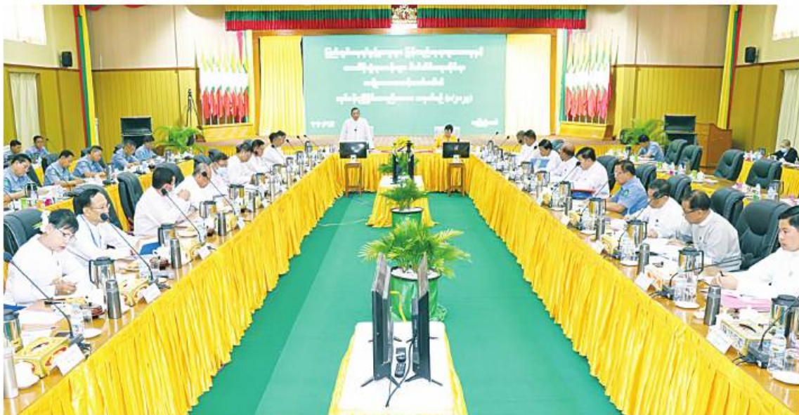
ပြည်ထောင်စုဝန်ကြီး ဒုတိယဗိုလ်ချုပ်ကြီးထွန်းထွန်းနောင် ပြည်တွင်းနေရပ်စွန့်ခွာသူများ ပြန်လည်နေရာချထားရေးနှင့် ယာယီခိုလှုံရာစခန်းများ ပိတ်သိမ်းရေးဆိုင်ရာ အမျိုးသားအဆင့်ကော်မတီ၏ လုပ်ငန်းညှိနှိုင်းအစည်းအဝေးအမှတ်စဉ်(၁/၂၀၂၃)တွင် အမှာစကား ပြောကြားစဉ်။

လုပ်ငန်းကော်မတီများ၊ ပြည်နယ်အဆင့်ကော်မတီများအနေဖြင့် ပြည်တွင်းနေရပ်စွန့်ခွာသူများ ပြန်လည်နေရာချထားရေးနှင့် ယာယီခိုလှုံရာစခန်းများ ပိတ်သိမ်းရေးနှင့်စပ်လျဉ်း၍ စီမံချက်များအသီးသီး