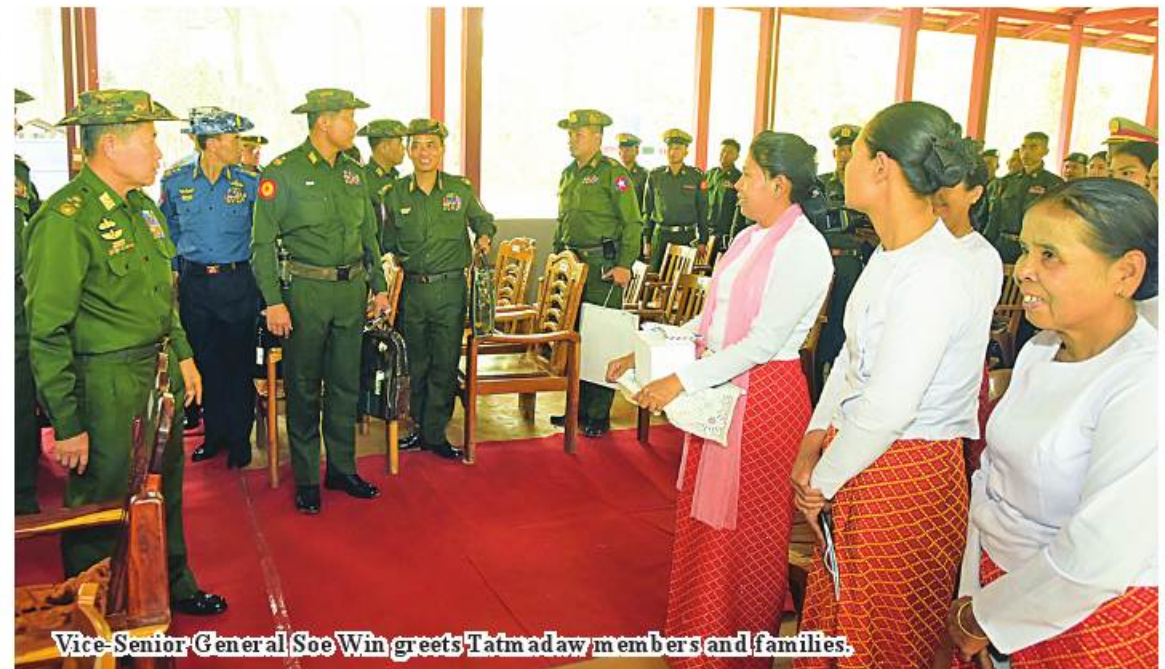
Vice-Senior General Soe Win greets Tatmadaw members and families.

After the meeting, the Vice-Senior General presented foodstuffs manufactured by Tatmadaw factories for the officers, other ranks and