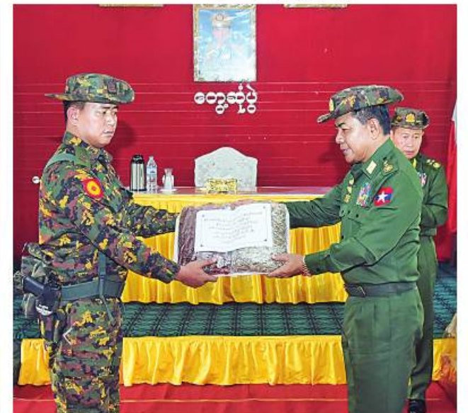
ညှိနှိုင်းကွပ်ကဲရေးမှူး(ကြည်း၊ရေ၊လေ) ဗိုလ်ချုပ်ကြီးမောင်မောင်အေး စားသောက်ဖွယ်ရာများပေးအပ်ရာ နောင်ဦးတပ်နယ်မှ တာဝန်ရှိသူ တစ်ဦးက လက်ခံရယူစဉ်။