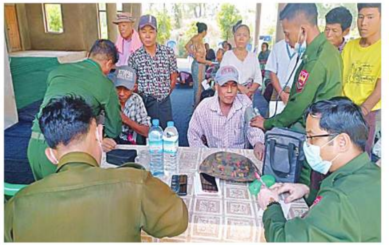
အလယ်ပိုင်းတိုင်းစစ်ဌာနချုပ် ဆေးကုသရေးအဖွဲ့က ဒေသခံပြည်သူများကို ကျန်းမာရေးစောင့်ရှောက်မှုလုပ်ငန်းများ ဆောင်ရွက်ပေးစဉ်။