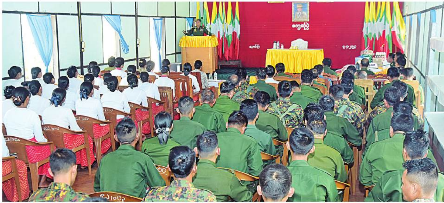
နိုင်ငံတော်စီမံအုပ်ချုပ်ရေးကောင်စီဒုတိယဥက္ကဋ္ဌ ဒုတိယတပ်မတော်ကာကွယ်ရေးဦးစီးချုပ် ကာကွယ်ရေးဦးစီးချုပ်(ကြည်း) ဒုတိယဗိုလ်ချုပ်မှူးကြီးစိုးဝင်း နောင်ဦးတပ်နယ်မှ အရာရှိ၊ ဓမ္မသည်၊ မိသားစုများကို တွေ့ဆုံအမှာစကားပြောကြားစဉ်။

အထည်ဖော်နိုင်ရန် လိုအပ်ကြောင်း။ တပ်တွင်း စည်းလုံးညီညွတ်ရေးနှင့် ပတ်သက်၍ တပ်၏အောင်မြင်မှု၊ ဆုံးရှုံးမှု အဆုံးအဖြတ်တွင် စည်းလုံးညီညွတ်မှုသည် အရေးကြီးကြောင်း၊ နိုင်ငံကိုဖျက်ဆီးလိုသူ များသည် နိုင်ငံတော်၏ အဓိကဒေါက်တိုင် ဖြစ်သော တပ်မတော်ကိုဖြိုခွဲရန် နည်းမျိုးစုံ ဖြင့် ကြိုးပမ်းလျက်ရှိသော်လည်း တပ်မတော် သားနှင့် မိသားစုဝင်တို့၏ ရေပက်မဝင်သော စည်းလုံးညီညွတ်မှုကြောင့် ခိုင်မာတောင့်တင်း သော Institution အဖြစ် နိုင်ငံတော်ကို ကာကွယ်စောင့်ရှောက်လျက်ရှိကြောင်း။ တပ်မတော်သားများ၏ လုပ်ငန်း သဘောသဘာဝအရ ခက်ခဲကြမ်းတမ်း၍ ပင်ပန်းဆင်းရဲသော ရည်မှန်းချက်တာဝန်များ ထမ်းဆောင်နေရသူများဖြစ်၍ အမြဲ ကိုယ်စိတ်နှစ်ပါး ကျန်းမာကြံ့ခိုင်နေရမည် ဖြစ်ကြောင်း၊ စာဖတ်ခြင်းသည် စိတ်ဓာတ် ကြံ့ခိုင်ရန် ကြီးမားသောအထောက်အကူဖြစ် ကြောင်း၊ အဆင့်အတန်းအားလုံး ဖတ်ရှု လေ့လာနိုင်ရန်ရည်ရွယ်၍ တပ်မတော်