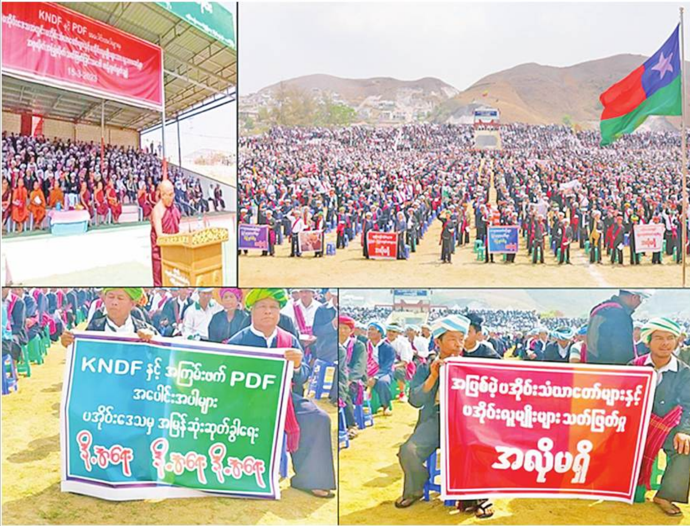
ပအိုဝ်းကိုယ်ပိုင်အုပ်ချုပ်ခွင့်ရဒေသအတွင်း KNDF၊ KNPP အဖွဲ့တို့နှင့် PDF အမည်ခံ အကြမ်းဖက်အဖွဲ့တွေက ပအိုဝ်းသံဃာတော်များနှင့် လူမျိုးများအား လူမဆန်စွာသတ်ဖြတ်မှုအပေါ် ပြင်းထန်စွာဆန့်ကျင်ရုတ်ချကြောင်း ဆန္ဒထုတ်ဖော်မှုများကို တွေ့ရစဉ်။

ကမ္ဘာ့ကုလသမဂ္ဂ အထွေထွေအတွင်းရေးမှူးချုပ်ရဲ့ မြန်မာနိုင်ငံဆိုင်ရာ အထူးကိုယ်စားလှယ် မစ္စန်လင်းဟောလီဆီက အိတ်ဖွင့်ပေးစာရေးတယ်ဆိုလို့ ဘယ်သူများလဲလို့ စိတ်ဝင်စားနေကြပါလိမ့်မယ်။ ကျွန်တော်က ကိုယ့်နိုင်ငံ၊ ကိုယ့်လူမျိုးကို ချစ်မြတ်နိုးတဲ့ သာမန်ပြည်သူတစ်ယောက်သာ ဖြစ်ပါတယ်။ အထူးသဖြင့် နိုင်ငံတကာအဖွဲ့အစည်းတွေ၊ လူပုဂ္ဂိုလ်တွေအနေနဲ့ ကိုယ့်နိုင်ငံ၊ ကိုယ့်လူမျိုး ပျက်စီးရာပျက်စီးကြောင်း၊ တစ်ဖက်သတ် စွပ်စွဲချက်တွေ၊ ဖိအားပေးမှုတွေကို လက်မခံနိုင်တဲ့ သာမန်ပြည်သူတစ်ဦးဆိုရင် ပိုမှန်ပါလိမ့်မယ်။ သာမန်ပြည်သူတစ်ဦးအနေနဲ့ ကုလသမဂ္ဂအတွင်းရေးမှူးချုပ်ရဲ့ အထူးကိုယ်စားလှယ်ဆီကို ဒီလိုအိတ်ဖွင့်စာပေးခြင်းကလည်း ဒီမိုကရေစီအစွင့်အရေအရ မိမိရဲ့ထင်မြင်ယူဆချက်၊ စံအချက်တွေကို သက်ဆိုင်ရာပုဂ္ဂိုလ်တွေ၊ အဖွဲ့အစည်းတွေသိရှိနိုင်အောင် ပေးပို့ရခြင်းဖြစ်ပါတယ်။ ဒီစာကို သက်ဆိုင်သူထံရောက်အောင် နည်းမျိုးစုံနဲ့ ပေးပို့ထားပြီးဖြစ်သလို နိုင်ငံတကာနဲ့ အများပြည်သူသိရှိနိုင်အောင် အရလိုဆောင်းပါးရေးသားဖော်ပြရခြင်းဖြစ်ပါတယ်။ ဒီအိတ်ဖွင့်ပေးစာမှာရေးသားထားတဲ့ အချက်တွေကတော့ ပြီးခဲ့တဲ့ မတ်လ ၁၆ ရက်နေ့က နိုလင်းဟောလီဆီ အနေနဲ့ ကုလသမဂ္ဂအထွေထွေညီလာခံမှာ မြန်မာနိုင်ငံနဲ့ပတ်သက်ပြီး တစ်ဖက်သတ်စွပ်စွဲပြောကြားချက်တွေကို တုံ့ပြန်အသိပေးထောက်ပြလိုခြင်းဖြစ်ပါတယ်။ သက်ဆိုင်ရာ နိုင်ငံခြားရေးဝန်ကြီးဌာနက ဘယ်လိုတုံ့ပြန်ထားတယ်ဆိုတာ မသိပေမယ့် နိုလင်းဟောလီဆီပြောကြားချက်တွေဟာ တည်ဆဲအစိုးရကို ဆန့်ကျင်နေတဲ့ လူပုဂ္ဂိုလ်၊ အဖွဲ့အစည်းတွေရဲ့ လူမှုကွန်ရက်က အခြေအမြစ်မရှိတဲ့ သတင်းအတု၊ သတင်းအမှားတွေ၊ ဝါဒဖြန့်မှုတွေ၊ ဖော်ပြချက်တွေကို အခြေခံပြီး သံယောင်လိုက်ပြောဆိုထားခြင်းဖြစ်တာကြောင့် ယခုလို အိတ်ဖွင့်ပေးစာပေးပို့ရခြင်းဖြစ်ပါတယ်။ နိုလင်းဟောလီဆီက မြန်မာနိုင်ငံမှာ တပ်မတော်က