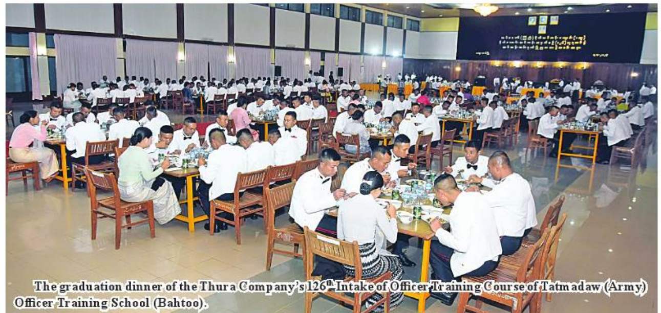
The graduation dinner of the Thura Company's 126 th Intake of Officer Training Course of Tatmadaw (Army) Officer Training School (Bahtoo).

Then, the Vice-Senior General and party enjoyed the performance of the mobile public relations troupe under the Directorate of Public Relations and Psychological Welfare at the Thabin Hall.