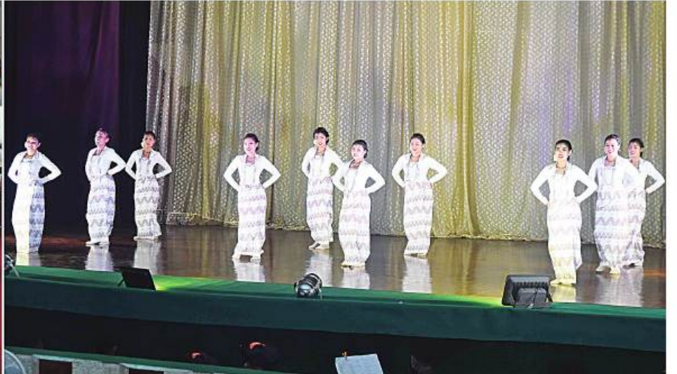
နိုင်ငံတော်စီမံအုပ်ချုပ်ရေးကောင်စီဒုတိယဥက္ကဋ္ဌ ဒုတိယတပ်မတော်ကာကွယ်ရေးဦးစီးချုပ် ကာကွယ်ရေးဦးစီးချုပ်(ကြည်း) ဒုတိယဗိုလ်ချုပ်မှူးကြီးစိုးဝင်းနှင့်အဖွဲ့ဝင်များ ပြည်သူ့ဆက်ဆံရေးနှင့် ဓိတ်ဓာတ်စစ်ဆင်ရေး ညွှန်ကြားရေးမှူးရုံး ကွပ်ကဲမှုအောက် နယ်လှည့်ပြည်သူ့ဆက်ဆံရေးအဖွဲ့၏ ဂုဏ်ပြုဖျော်ဖြေတင်ဆက်မှုများကို ကြည့်ရှုအားပေးစဉ်။

နေပြည်တော် ဧပြီ ၇ တပ်မတော်(ကြည်း) ဗိုလ်သင်တန်းကျောင်း(ပထူး) ဗိုလ်လောင်းသင်တန်းအမှတ်စဉ်(၁၂၆) သူရတပ်ခွဲသင်တန်းဆင်းဂုဏ်ပြုညစာစားပွဲအခမ်းအနားကို ယနေ့ညပိုင်းတွင် ပထူးမြို့ တပ်မတော်(ကြည်း) ဗိုလ်သင်တန်းကျောင်း(ပထူး) စစ်ရာထူးခန့်ထားရေးခန်းမဆောင်၌ကျင်းပရာ နိုင်ငံတော်စီမံအုပ်ချုပ်ရေးကောင်စီဥက္ကဋ္ဌ တပ်မတော်