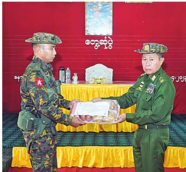
နိုင်ငံတော်စီမံအုပ်ချုပ်ရေးကောင်စီဒုတိယဥက္ကဋ္ဌ ဒုတိယတပ်မတော် ကာကွယ်ရေးဦးစီးချုပ် ကာကွယ်ရေးဦးစီးချုပ်(ကြည်း) ဒုတိယဗိုလ်ချုပ်မှူးကြီးစိုးဝင်း နောင်ဦးတပ်နယ်မှ အရာရှိ၊ ဓမ္မသည်၊ မိသားစု များအတွက် တပ်မတော်ခက်ခဲမှုများမှ ထုတ်လုပ်သည့် စားသောက်ကုန် ပစ္စည်းများပေးအပ်ရာ တာဝန်ရှိသူတစ်ဦးက လက်ခံရယူစဉ်။

အထည်ဖော်နိုင်ရန် လိုအပ်ကြောင်း။ တပ်တွင်း စည်းလုံးညီညွတ်ရေးနှင့် ပတ်သက်၍ တပ်၏အောင်မြင်မှု၊ ဆုံးရှုံးမှု အဆုံးအဖြတ်တွင် စည်းလုံးညီညွတ်မှုသည် အရေးကြီးကြောင်း၊ နိုင်ငံကိုဖျက်ဆီးလိုသူ များသည် နိုင်ငံတော်၏ အဓိကဒေါက်တိုင် ဖြစ်သော တပ်မတော်ကိုဖြိုခွဲရန် နည်းမျိုးစုံ ဖြင့် ကြိုးပမ်းလျက်ရှိသော်လည်း တပ်မတော် သားနှင့် မိသားစုဝင်တို့၏ ရေပက်မဝင်သော စည်းလုံးညီညွတ်မှုကြောင့် ခိုင်မာတောင့်တင်း သော Institution အဖြစ် နိုင်ငံတော်ကို ကာကွယ်စောင့်ရှောက်လျက်ရှိကြောင်း။ တပ်မတော်သားများ၏ လုပ်ငန်း သဘောသဘာဝအရ ခက်ခဲကြမ်းတမ်း၍ ပင်ပန်းဆင်းရဲသော ရည်မှန်းချက်တာဝန်များ ထမ်းဆောင်နေရသူများဖြစ်၍ အမြဲ ကိုယ်စိတ်နှစ်ပါး ကျန်းမာကြံ့ခိုင်နေရမည် ဖြစ်ကြောင်း၊ စာဖတ်ခြင်းသည် စိတ်ဓာတ် ကြံ့ခိုင်ရန် ကြီးမားသောအထောက်အကူဖြစ် ကြောင်း၊ အဆင့်အတန်းအားလုံး ဖတ်ရှု လေ့လာနိုင်ရန်ရည်ရွယ်၍ တပ်မတော်