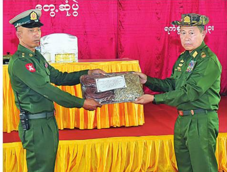
နိုင်ငံတော်စီမံအုပ်ချုပ်ရေးကောင်စီဒုတိယဥက္ကဋ္ဌ ဒုတိယတပ်မတော်ကာကွယ်ရေးဦးစီးချုပ် ကာကွယ်ရေးဦးစီးချုပ်(ကြည်း) ဒုတိယဗိုလ်ချုပ်မှူးကြီးစိုးဝင်း ကျိုင်းခမ်းတပ်နယ်မှ အရာရှိ၊ စစ်သည်၊ မိသားစုများအတွက် တပ်မတော်စက်ရုံများမှ ထုတ်လုပ်သည့် ဓားသောက်ကုန်ပစ္စည်းများပေးအပ်ရာ တာဝန်ရှိသူတစ်ဦးက လက်ခံရယူစဉ်။

တပ်မတော်ဖြစ်ကြောင်း၊ ၂၀၀၈ ခုနှစ် ဖွဲ့စည်းပုံအခြေခံဥပဒေအရ နိုင်ငံတော်၏ အမျိုးသားနိုင်ငံရေးဦးဆောင်မှုအခန်းကဏ္ဍတွင် တပ်မတော်က ပါဝင်ထမ်းဆောင်နိုင်ရေး