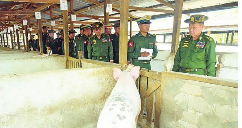
နိုင်ငံတော်စီမံအုပ်ချုပ်ရေးကောင်စီဒုတိယဥက္ကဋ္ဌ ဒုတိယတပ်မတော်ကာကွယ်ရေးဦးစီးချုပ် ကာကွယ်ရေးဦးစီးချုပ်(ကြည်း) ဒုတိယဗိုလ်ချုပ်မှူးကြီးစိုးဝင်း ကျိုင်းစမ်းတပ်နယ် နယ်မြေစံတပ်ရှိ ဥစားကြက်နှင့် DYLဝက်များ မွေးမြူထားရှိမှုများကို ကြည့်ရှုစစ်ဆေးစဉ်။

စာမျက်နှာ ၂၂ မှအဆက် ကလေးအားလုံး ကျောင်းနေနိုင်ရေးနှင့် ကျောင်းနေသူအားလုံး KG+9 မဖြစ်မနေ တတ်မြောက်ရန် မူဝါဒချမှတ်ခဲ့ကြောင်း၊ ကျန်းမာရေးကဏ္ဍတွင်လည်း ကိုဗစ်-၁၉ ဒုတိယလှိုင်းပြင်းထန်ချိန် “လူအသက်ထက် အရေးကြီးတာ ဘာမှမရှိ” ဟု မူဝါဒချမှတ်၍ ကုသရေးအတွက်လိုအပ်သော ဆေးဝါးနှင့် အောက်ဆီဂျင်များရရှိအောင်စီမံဆောင်ရွက် ခဲ့သကဲ့သို့ ပြည်သူလူထုအားလုံး ကာကွယ် ဆေးအလုံအလောက်ထိုးနှံနိုင်ရေးဆောင်ရွက်