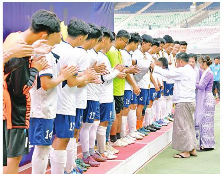
နိုင်ငံတော်စီမံအုပ်ချုပ်ရေးကောင်စီ တွဲဖက်အတွင်းရေးမှူး ဒုတိယဝိုင်းလှည့်မှုကြီးရဲဝင်းဦး က ပထမဆုရရှိသည့် နည်းပညာတက္ကသိုလ်(အထက်မြန်မာပြည်) (က)အသင်းကို တံခွန်ချင်းဆုတံဆိပ်များ ပေးအပ်ချီးမြှင့်စဉ်။

ညနေပိုင်းတွင် နေပြည်တော်ရှိ ဝဏ္ဏသိဒ္ဓိ ဘောလုံးကွင်း၌ ကျင်းပရာ နိုင်ငံတော်စီမံ အုပ်ချုပ်ရေးကောင်စီဥက္ကဋ္ဌ နိုင်ငံတော် ဝန်ကြီးချုပ် ဝိုင်းလှည့်မှုကြီးမင်းအောင်လှိုင် တက်ရောက်ကြည့်ရှုအားပေးပြီး ဆုများ ပေးအပ်ချီးမြှင့်သည်။ အခမ်းအနားသို့ နိုင်ငံတော်စီမံအုပ်ချုပ် ရေးကောင်စီ တွဲဖက်အတွင်းရေးမှူး ဒုတိယဝိုင်းလှည့်မှုကြီးရဲဝင်းဦး၊ ကောင်စီဝင် များပြည်ထောင်စုဝန်ကြီးများပြည်ထောင်စု အဆင့်ပုဂ္ဂိုလ်များ၊ နေပြည်တော်ကောင်စီ ဥက္ကဋ္ဌတပ်မတော်အရာရှိကြီးများ၊နေပြည် တော်တိုင်းစစ်ဌာနချုပ် တိုင်းမှူး၊ ဒုတိယ ဝန်ကြီးများ၊ တိုင်းဒေသကြီးနှင့် ပြည်နယ် အသီးသီးရှိ သိပ္ပံနှင့်နည်းပညာဝန်ကြီးဌာန အောက် တက္ကသိုလ်ပေါင်းစုံမှ ပါမောက္ခချုပ် များနှင့် ပါမောက္ခများ၊ အားကစားအသင်း များအလိုက် အုပ်ချုပ်သူများ၊ နည်းပြများနှင့် အားကစားသမားများ၊ ဝန်ကြီးဌာနများမှ