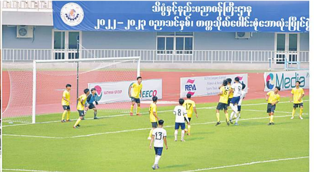
နိုင်ငံတော်စီမံအုပ်ချုပ်ရေးကောင်စီဥက္ကဋ္ဌ နိုင်ငံတော်ဝန်ကြီးချုပ် ဝိုင်းလှည့်မှုကြီးမင်းအောင်လှိုင် သိပ္ပံနှင့်နည်းပညာဝန်ကြီးဌာန တက္ကသိုလ်ပေါင်းစုံဘောလုံးပြိုင်ပွဲ ဝိုင်းလှည့်တွင် ကွန်ပျူတာတက္ကသိုလ် (အောက်မြန်မာပြည်) (က)အသင်းနှင့် နည်းပညာတက္ကသိုလ်(အထက်မြန်မာပြည်) (က)အသင်းတို့ ယှဉ်ပြိုင်ကစားနေမှုကို ကြည့်ရှုအားပေးစဉ်။

နေပြည်တော် ၈ ဖြေ ၇ သိပ္ပံနှင့် နည်းပညာဝန်ကြီးဌာန တက္ကသိုလ်ပေါင်းစုံ ဘောလုံးပြိုင်ပွဲဝိုင်းလှည့်ပွဲ နှင့် ဆုချီးမြှင့်ခြင်းအခမ်းအနားကို ယနေ့