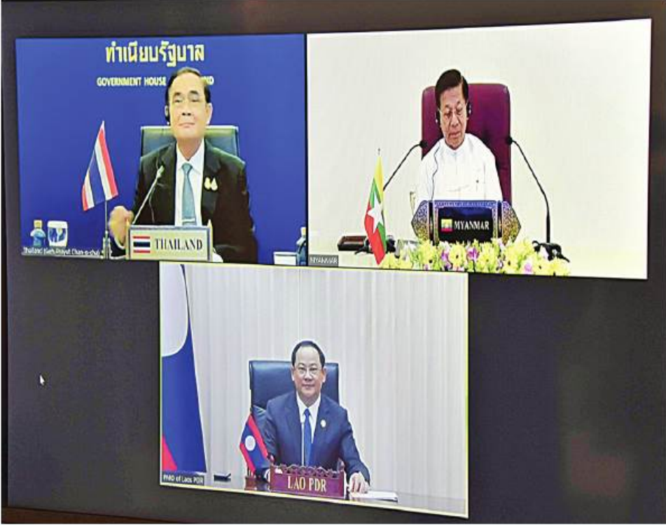
နိုင်ငံတော်စီမံအုပ်ချုပ်ရေးကောင်စီဥက္ကဋ္ဌ နိုင်ငံတော်ဝန်ကြီးချုပ် ဗိုလ်ချုပ်မှူးကြီးမင်းအောင်လှိုင် မြန်မာနိုင်ငံ၊ ထိုင်းနိုင်ငံနှင့် လာအိုနိုင်ငံတို့အကြား နယ်စပ်ဖြတ်ကျော် မီးခိုးမြူငွေ ညစ်ညမ်းမှုဆိုင်ရာ သုံးဦးသုံးဖလှယ်အစည်းအဝေးတွင် Video Conferencing ဖြင့် တွေ့ဆုံဆွေးနွေးပြောကြားစဉ်။

နေပြည်တော် စင်္ကြံ ၇ မြန်မာနိုင်ငံ၊ ထိုင်းနိုင်ငံနှင့် လာအိုနိုင်ငံတို့အကြား နယ်စပ်ဖြတ်ကျော်မီးခိုးမြူငွေ ညစ်ညမ်းမှုဆိုင်ရာ သုံးဦးသုံးဖလှယ်အစည်းအဝေးကို ယနေ့နံနက်ပိုင်းတွင် Video Conferencing ဖြင့် တွေ့ဆုံ