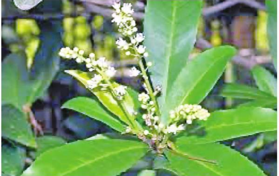
ဆေးဖက်ဝင် သက်ရင်းကြီးပင်ကို တွေ့ရစဉ်။

ဖြေ ။ ။ ပြောပုံအရခန့်မှန်းကြည့်ရတာ ညာဘက် ခြေက ဘယ်ဘက်ခြေထက်နိမ့်နေတာ ဒါမှမဟုတ် ပိုရှည်နေတာဖြစ်နိုင်ပါတယ်။ အနောက်တိုင်းဆေးပညာအရ Dislo- cation Leg လို့ခေါ်ပါတယ်။ မြန်မာလို ကတော့ တင်ပါးခွက်လျှောတာ ဒါမှ မဟုတ် တင်ပါးခွက်တက်တာပေါ့။ ကုသ ပေးတဲ့ဆရာက သေချာစစ်ဆေးပေးဖို့ လိုပါတယ်။ လူနာကိုအိပ်ခိုင်း၊ ဒူးဆစ်က နေဖိထားပြီး ဖောင့်နှစ်ဖက်ဘေးချင်း ကပ် တစ်ဖက်နဲ့တစ်ဖက် အတိုအရှည် ညီ မညီ တိုင်းကြည့်ရပါမယ်။ အခု ခံစားချက်ဖြစ်နေတဲ့ ညာဘက်ခြေ ဖောင့်မှာ ပေတံထောက်ပြီး ကျန် ဖောင့်ထက် တိုနေသလား၊ ရှည်နေ သလားဆိုတာကို တိုင်းကြည့်ရမှာပါ။ ခြေတစ်ဖက်တိုနေရင် အောက်ကိုဆွဲချ