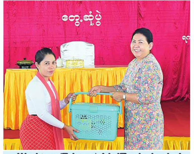
ညိုနှိုင်းကွပ်ကဲရေးမှူး(ကြည်း၊ ရေလေ) ဗိုလ်ချုပ်ကြီးမောင်မောင်အေး၏ ဇနီးက ဓားသောက်ဖွယ်ရာများပေးအပ်ရာ ကျိုင်းခမ်းတပ်နယ်မှ တာဝန်ရှိသူတစ်ဦးက လက်ခံရယူစဉ်။