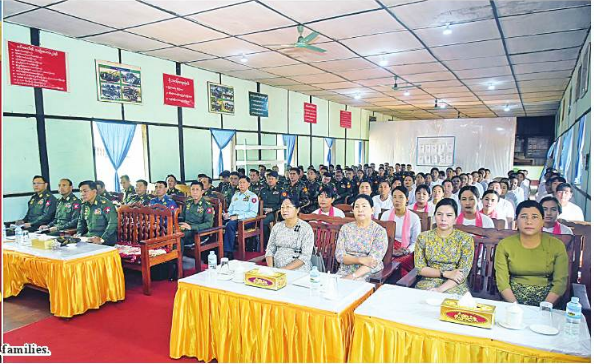
Vice-Senior General Soe Win meets Tatmadaw members and families.