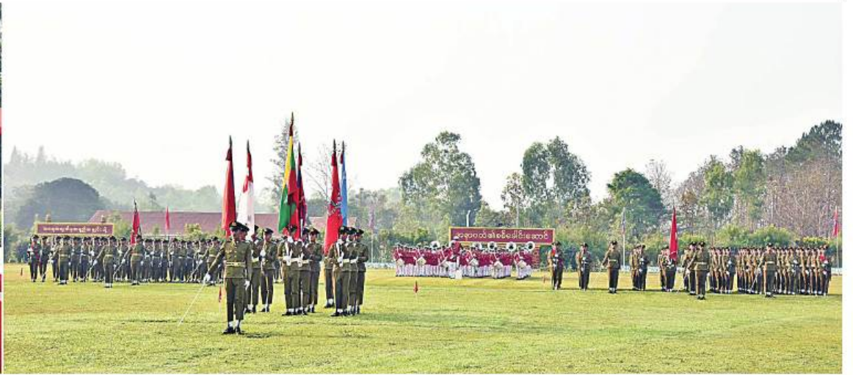
နိုင်ငံတော်စီမံအုပ်ချုပ်ရေးကောင်စီဒုတိယဥက္ကဋ္ဌ ဒုတိယတပ်မတော်ကာကွယ်ရေးဦးစီးချုပ် ကာကွယ်ရေးဦးစီးချုပ်(ကြည်း) ဒုတိယဗိုလ်ချုပ်မှူးကြီး သီရိပျံချီ မဟာသရေစည်သူစိုးဝင်း ဗိုလ်လောင်းတပ်ခွဲများ၏ အလေးပြုခြင်းကိုခံယူစဉ်။