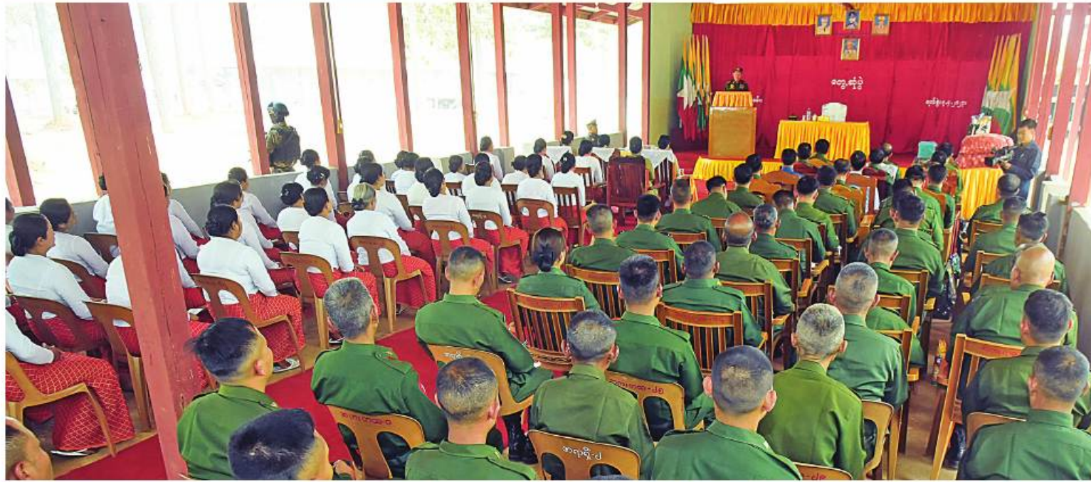
နိုင်ငံတော်စီမံအုပ်ချုပ်ရေးကောင်စီဒုတိယဥက္ကဋ္ဌ ဒုတိယတပ်မတော်ကာကွယ်ရေးဦးစီးချုပ် ကာကွယ်ရေးဦးစီးချုပ်(ကြည်း) ဒုတိယဗိုလ်ချုပ်မှူးကြီးစိုးဝင်း ကျိုင်းခမ်းတပ်နယ်မှ အရာရှိ၊ စစ်သည်၊ မိသားစုများကို တွေ့ဆုံအမှာစကားပြောကြားစဉ်။

တို့ကို အစဉ်တစိုက်ဦးတည်သည့်ဟု ပြဋ္ဌာန်းထားပြီး ဦးတန်းအရေးသုံးပါးကို ကာကွယ်စောင့်ရှောက်နေကြောင်း၊ နိုင်ငံတော်အပေါ် ကျရောက်လာနိုင်သော မည်သည့်အန္တရာယ်ကိုမဆို ကာကွယ်တားဆီးရန်အသင့်ရှိသော တပ်မတော်ဖြစ်ကြောင်း။ ပြည်သူ့လိုလားသည့် ဒီမိုကရေစီကို ထိန်းသိမ်းစောင့်ရှောက်နိုင်ရန် ဖွဲ့စည်းပုံအခြေခံဥပဒေ၏ ပေးအပ်ထားသော တာဝန်အရ နိုင်ငံတော်အာဏာကိုထိန်းသိမ်းစွဲရပြီး ရှေ့လုပ်ငန်းစဉ်(၅)ရပ်ကို ရုရှားက နိုင်ငံတော်တာဝန်များကို ထမ်းဆောင်လျက်ရှိကြောင်း၊ ယခင်အစိုးရလက်ထက်တွင် အကြောင်းအမျိုးမျိုးကြောင့် ကျဆင်းခဲ့ရသည့် နိုင်ငံစီးပွားရေးကို ပြန်လည်မြှင့်တင်နိုင်ရေး နိုင်ငံတော်ဝန်ကြီးချုပ်ကိတ်တိုင်ပြည်တွင်းကုန်ထုတ်လုပ်မှုကို အားပေးရန် MSME အဖွဲ့များနှင့်တွေ့ဆုံ၍ အားပေးမြှင့်တင်မှုများ ဆောင်ရွက်ခဲ့ကြောင်း၊ ယခုအခါ နိုင်ငံစီးပွားရေးအခြေအနေမှာ အသင့်အတင့်တိုးတက်လာသည်ကို တွေ့ရမည်ဖြစ်ကြောင်း။ အလားတူ နိုင်ငံ၏ပညာရေးအားနည်းမှုကိုမြှင့်တင်နိုင်ရန် ကျောင်းနေအရွယ်