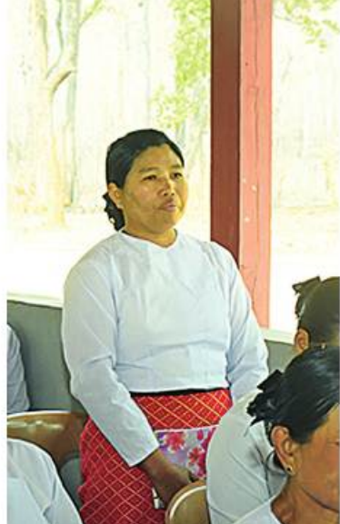
ကျိုင်းခမ်းတပ်နယ်မှ ရဲမတစ်ဦးက တင်ပြစဉ်။