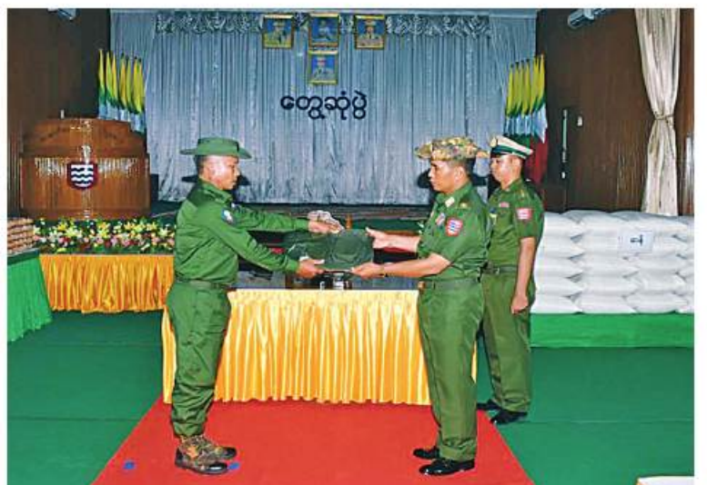
အနောက်တောင်တိုင်းစစ်ဌာနချုပ် တိုင်းမှူး ဗိုလ်မှူးချုပ်ကြည်ခိုင် ပြည်သူ့စစ်(ဌာနေ) တပ်ဖွဲ့ဝင်များကို ယူနီဖောင်းနှင့် စားသောက်ဖွယ်ရာများ ထောက်ပံ့ပေးအပ်စဉ်။

ရောဝတီတိုင်းဒေသကြီး ပုသိမ်မြို့နယ် အတွင်းရှိ ပြည်သူ့စစ်(ဌာနေ)တပ်ဖွဲ့ဝင် များကို ရိက္ခာအမည် လေးမျိုး၊ ယူနီဖောင်းနှင့် စားသောက်ဖွယ်ရာများ ထောက်ပံ့ ပေးအပ်ခြင်းကို ယနေ့နံနက်ပိုင်းတွင် တိုင်းစစ်ဌာနချုပ် ရောဝတီခန်းမ၌ပြုလုပ်ရာ အနောက်တောင်တိုင်းစစ်ဌာနချုပ် တိုင်းမှူး ဗိုလ်မှူးချုပ်ကြည်ခိုင်နှင့် တာဝန်ရှိသူများ၊ ပြည်သူ့စစ်(ဌာနေ) တပ်ဖွဲ့ဝင်များနှင့် ဖိတ်ကြားထားသူများ တက်ရောက်ကြသည်။ ဦးစွာ တိုင်းမှူးက အဖွင့်အမှာစကား ပြောကြားပြီး ပြည်သူ့စစ်(ဌာနေ) တပ်ဖွဲ့ဝင် များ၏ တင်ပြချက်များအပေါ် လိုအပ်သည် များအား ညှိနှိုင်းဆောင်ရွက်ပေးခဲ့ကြောင်း သတင်းရရှိသည်။