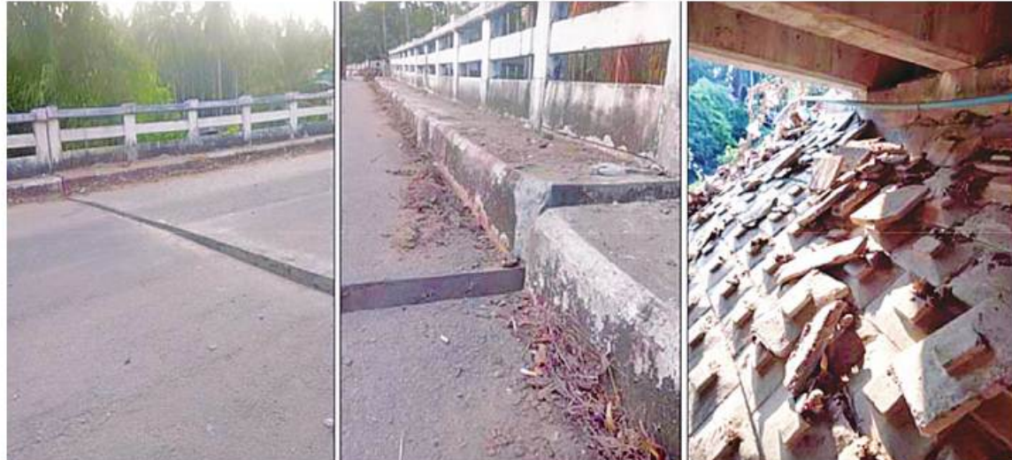
တနင်္သာရီမြို့နယ်၌ PDF အမည်ခံ အကြမ်းဖက်သမားများက မြိတ်-တနင်္သာရီ ပြည်ထောင်စုလမ်းရှိ တံတားအမှတ် ၃/၅၀၆ သံကူကွန်ကရစ်တံတားကို မိုင်းထောင်ဖောက်ခွဲဖျက်ဆီးခဲ့မှုမှတ်တမ်းဓာတ်ပုံ။

ထိုသို့ မိုင်းထောင်ဖောက်ခွဲဖျက်ခြင်း တစ်ပေခွဲခန့်နှင့် တံတားကြမ်းခင်းအလယ် အရှည် ပေ ၂၀ ခန့်တို့တွင် နှစ်လက်မခန့် နိမ့်ကျပျက်စီးခဲ့ကြောင်း သိရသည်။ ထိုသို့ အများပြည်သူသွားလာအသုံးပြု လျက်ရှိသည့် သံကူကွန်ကရစ်တံတားကို မိုင်းထောင် ဖောက်ခွဲဖျက်ဆီးခဲ့သည့် အကြမ်းဖက်သမားများကို ဖမ်းဆီးအရေး ယူနိုင်ရေးနှင့် နယ်မြေဒေသတည်ငြိမ် အေးချမ်းရေးအတွက် လုံခြုံရေးတပ်ဖွဲ့ဝင် များက လုံခြုံရေးလုပ်ငန်းစဉ်များနှင့်အညီ ဆက်လက် ဆောင်ရွက်လျက်ရှိကြောင်း သတင်းရရှိသည်။