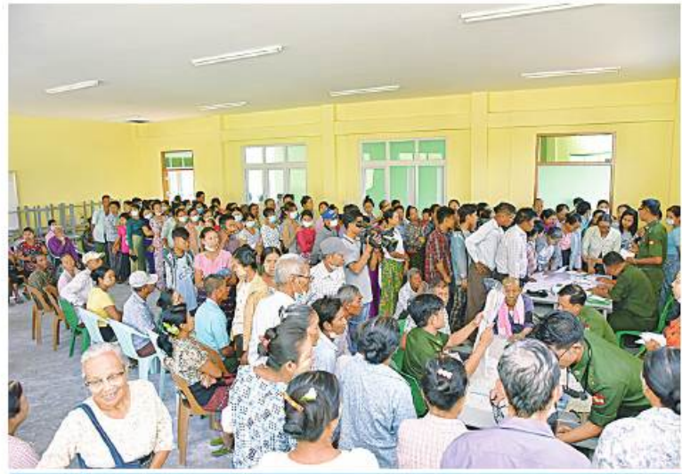
တပ်မတော်နယ်လှည့် အထူးဆေးကုသရေးအဖွဲ့က ဒေသခံပြည်သူများကို ကျန်းမာရေးစောင့်ရှောက်မှုလုပ်ငန်းများ ဆောင်ရွက်ပေးစဉ်။

နေပြည်တော် ၈ ဇူလိုင် ၇ - စစ်ကိုင်းတိုင်းဒေသကြီးအတွင်း ရောက် ရှိနေသော တပ်မတော်နယ်လှည့်အထူး ဆေးကုသရေးအဖွဲ့သည် ယနေ့တွင် စစ်ကိုင်းမြို့နယ် အုန်းတောကျေးရွာ အခြေခံပညာ အထက်တန်းကျောင်း၌ အခြေပြု၍ အဆိုပါကျေးရွာနှင့်ပတ်ဝန်း ကျင်ကျေးရွာများမှ သံယာတော်များနှင့် ဒေသခံပြည်သူ စုစုပေါင်း ၅၄၉ ဦးတို့ကို ကျန်းမာရေး စောင့်ရှောက်မှုလုပ်ငန်းများ ဆောင်ရွက်ပေးသည်။