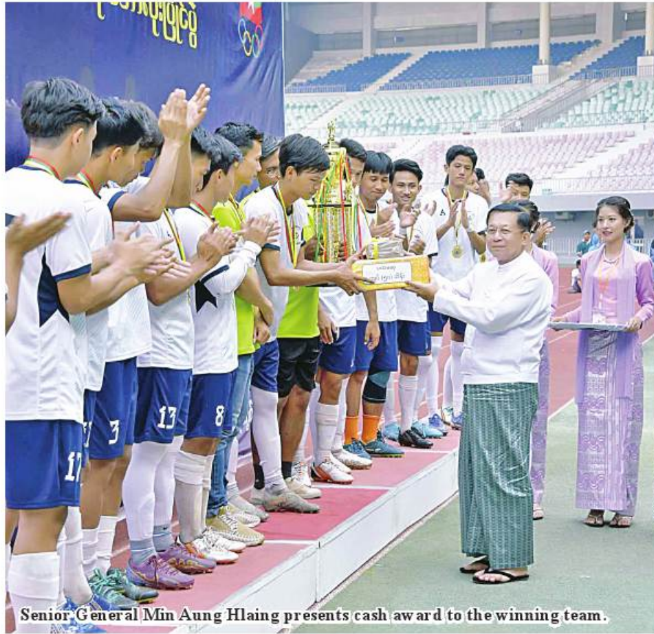
Senior General Min Aung Hlaing presents cash award to the winning team.

Nay Pyi Taw April 7 Technology and the prize presentation ceremony was held in the Wunna Theikdi Stadium in Nay Pyi Taw this evening and Chairman of the State Administration Council Prime Minister Senior General Min Aung Hlaing enjoyed