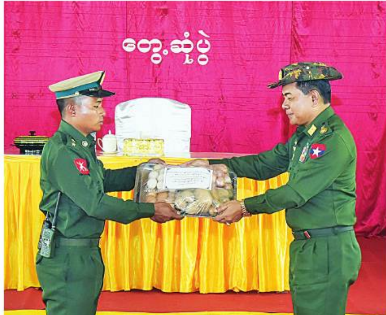
ညိုနှိုင်းကွပ်ကဲရေးမှူး(ကြည်း၊ ရေလေ) ဗိုလ်ချုပ်ကြီးမောင်မောင်အေး ဓားသောက်ဖွယ်ရာများပေးအပ်ရာ ကျိုင်းခမ်းတပ်နယ်မှ တာဝန်ရှိသူတစ်ဦးက လက်ခံရယူစဉ်။