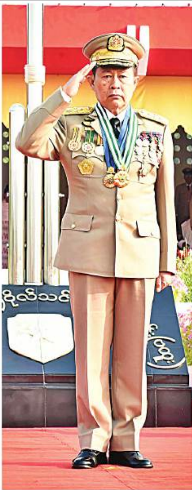
နိုင်ငံတော်စီမံအုပ်ချုပ်ရေးကောင်စီဒုတိယဥက္ကဋ္ဌ ဒုတိယတပ်မတော်ကာကွယ်ရေးဦးစီးချုပ် ကာကွယ်ရေးဦးစီးချုပ်(ကြည်း) ဒုတိယဗိုလ်ချုပ်မှူးကြီး သီရိပျံချီ မဟာသရေစည်သူစိုးဝင်း ကျောင်းဆင်းဗိုလ်လောင်းတပ်ခွဲများ၏ အနားလျှောက်၊ အမြန်လျှောက်ဖြင့် ချီတက်အလေးပြုခြင်းကို ခံယူစဉ်။

ခေါင်းဆောင်မှုနှင့် ပတ်သက်၍ စစ်တက္ကသိုလ် ဗိုလ်လောင်းသင်တန်းအမှတ်စဉ်(၆၄) သင်တန်းဆင်းပွဲတွင် တပ်မတော်ကာကွယ်ရေး ဦးစီးချုပ် ဗိုလ်ချုပ်မှူးကြီး သတိုးမဟာသရေစည်သူ သတိုးသီရိသုဓမ္မ မင်းအောင်လှိုင်က “ခေါင်းဆောင်မှုပညာရပ်ဆိုတာ ကျယ်ပြန့်နက်ရှိုင်းလှတာကြောင့် လေ့လာရင် လေ့လာသလောက် အကျိုးရှိမှာဖြစ်ကြောင်း၊ ငယ်သားဖြစ်ချိန်မှာ နောက်လိုက်ကောင်းတစ်ယောက်ဟာ နောင်တစ်ချိန်မှာ ခေါင်းဆောင်ကောင်း တစ်ယောက်ရဲ့ အစပုံဖြစ်ကြောင်း” ဟု မိန့်မှာချက်ကိုလည်း သိရှိလိုက်နာရန် လိုအပ်ကြောင်း။ ခေါင်းဆောင်များသည် အသိပညာ၊ အတတ်ပညာများနှင့်လည်း ပြည့်စုံရမှာဖြစ်သလို ၎င်းအသိပညာ၊ အတတ်ပညာများကို ကောင်းမွန်သည့် အတွေးအခေါ်နှင့် ပေါင်းစပ်ပြီး မှန်ကန်သည့်ခေါင်းဆောင်မှု၊