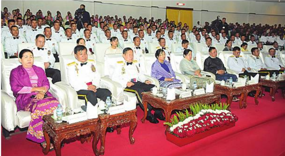
နိုင်ငံတော်စီမံအုပ်ချုပ်ရေးကောင်စီဒုတိယဥက္ကဋ္ဌ ဒုတိယတပ်မတော်ကာကွယ်ရေးဦးစီးချုပ် ကာကွယ်ရေးဦးစီးချုပ်(ကြည်း) ဒုတိယဗိုလ်ချုပ်မှူးကြီးစိုးဝင်းနှင့်အဖွဲ့ဝင်များ ပြည်သူ့ဆက်ဆံရေးနှင့် ဓိတ်ဓာတ်စစ်ဆင်ရေး ညွှန်ကြားရေးမှူးရုံး ကွပ်ကဲမှုအောက် နယ်လှည့်ပြည်သူ့ဆက်ဆံရေးအဖွဲ့၏ ဂုဏ်ပြုဖျော်ဖြေတင်ဆက်မှုများကို ကြည့်ရှုအားပေးစဉ်။