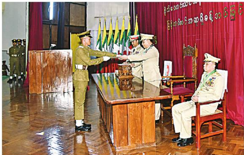
ကာကွယ်ရေးဦးစီးချုပ်(ကြည်း)မှ စစ်ရာထူးခန့်အပ်ဒုတိယဗိုလ်ချုပ်ကြီးလင်းအောင်ကျောင်းဆင်းဗိုလ်လောင်းတစ်ဦးချင်းစီအား ပြန်တမ်းဝင်အရာရှိများအား ဖြောင့်ပြောပြီး အခမ်းအနားကိုရုပ်သိမ်းလိုက်သည်။

နေပြည်တော် ၈ ဇူလိုင် တပ်မတော်(ကြည်း) ဗိုလ်သင်တန်းကျောင်း(ပထူး) ဗိုလ်လောင်းသင်တန်းအမှတ်စဉ်(၁၂၆) သူရတပ်ခွဲ ပြန်တမ်းဝင်အရာရှိခန့်အပ်ခြင်း အခမ်းအနားကို