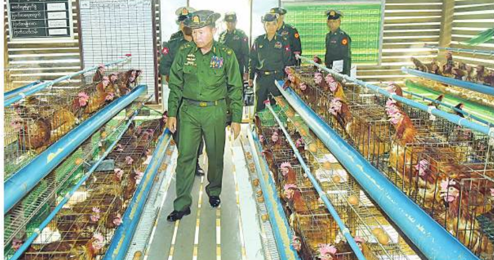
နိုင်ငံတော်စီမံအုပ်ချုပ်ရေးကောင်စီဒုတိယဥက္ကဋ္ဌ ဒုတိယတပ်မတော်ကာကွယ်ရေးဦးစီးချုပ် ကာကွယ်ရေးဦးစီးချုပ်(ကြည်း) ဒုတိယဗိုလ်ချုပ်မှူးကြီးစိုးဝင်း ကျိုင်းစမ်းတပ်နယ် နယ်မြေစံတပ်ရှိ ဥစားကြက်နှင့် DYLဝက်များ မွေးမြူထားရှိမှုများကို ကြည့်ရှုစစ်ဆေးစဉ်။