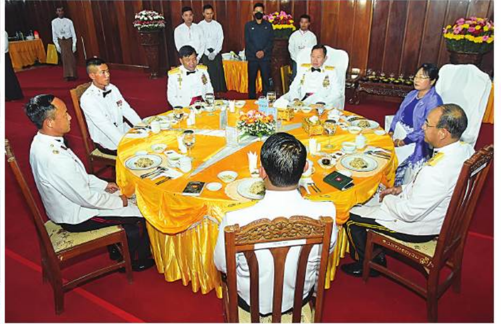
နိုင်ငံတော်စီမံအုပ်ချုပ်ရေးကောင်စီဒုတိယဥက္ကဋ္ဌ ဒုတိယတပ်မတော်ကာကွယ်ရေးဦးစီးချုပ် ကာကွယ်ရေးဦးစီးချုပ်(ကြည်း) ဒုတိယဗိုလ်ချုပ်မှူးကြီးစိုးဝင်း သင်တန်းဆင်းအရာရှိများနှင့်အတူ ညစာကို အတူတကွ သုံးဆောင်စဉ်။