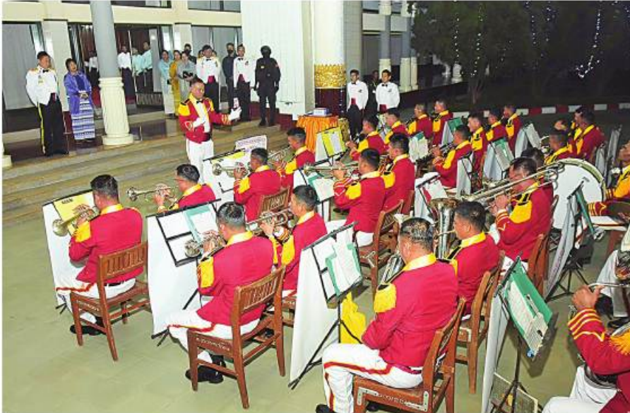
နိုင်ငံတော်စီမံအုပ်ချုပ်ရေးကောင်စီဒုတိယဥက္ကဋ္ဌ ဒုတိယတပ်မတော်ကာကွယ်ရေးဦးစီးချုပ် ကာကွယ်ရေးဦးစီးချုပ်(ကြည်း) ဒုတိယဗိုလ်ချုပ်မှူးကြီးစိုးဝင်း တပ်မတော်(ကြည်း)ဗိုလ်သင်တန်းကျောင်း(ပထူး) ဝမ်းတီးပိုင်းအဖွဲ့၏ ဂုဏ်ပြုတီးမှုကိုကြည့်ရှုအားပေးပြီး ချီးမြှင့်ငွေများပေးအပ်စဉ်။

ညစာသုံးဆောင်အပြီးတွင် နိုင်ငံတော်စီမံအုပ်ချုပ်ရေးကောင်စီ ဒုတိယဥက္ကဋ္ဌ ဒုတိယတပ်မတော်ကာကွယ်ရေးဦးစီးချုပ် ကာကွယ်ရေးဦးစီးချုပ်(ကြည်း)နှင့် အဖွဲ့ဝင်များသည် တပ်မတော်(ကြည်း)ဗိုလ်သင်တန်းကျောင်း(ပထူး) စစ်တီးပိုင်းအဖွဲ့၏ ဂုဏ်ပြုတီးမှုကို ကြည့်ရှုအားပေးပြီး ချီးမြှင့်ငွေများပေးအပ်သည်။ ထို့နောက် နိုင်ငံတော်စီမံအုပ်ချုပ်ရေးကောင်စီဒုတိယဥက္ကဋ္ဌ ဒုတိယတပ်မတော်ကာကွယ်ရေးဦးစီးချုပ် ကာကွယ်ရေးဦးစီးချုပ်(ကြည်း)နှင့်အဖွဲ့ဝင်များသည် ကျောင်းဆင်းအရာရှိများနှင့်အတူ သဘင်ဆောင်၌ ပြည်သူ့ဆက်ဆံရေးနှင့်စိတ်ဓာတ်စစ်ဆင်ရေးညွှန်ကြားရေးမှူးရုံး ကွပ်ကဲမှုအောက် နယ်လှည့်ပြည်သူ့ဆက်ဆံရေးအဖွဲ့၏ဂုဏ်ပြုဖျော်ဖြေတင်ဆက်မှုများကို ကြည့်ရှုအားပေးခဲ့ကြကြောင်း သတင်းရရှိသည်။