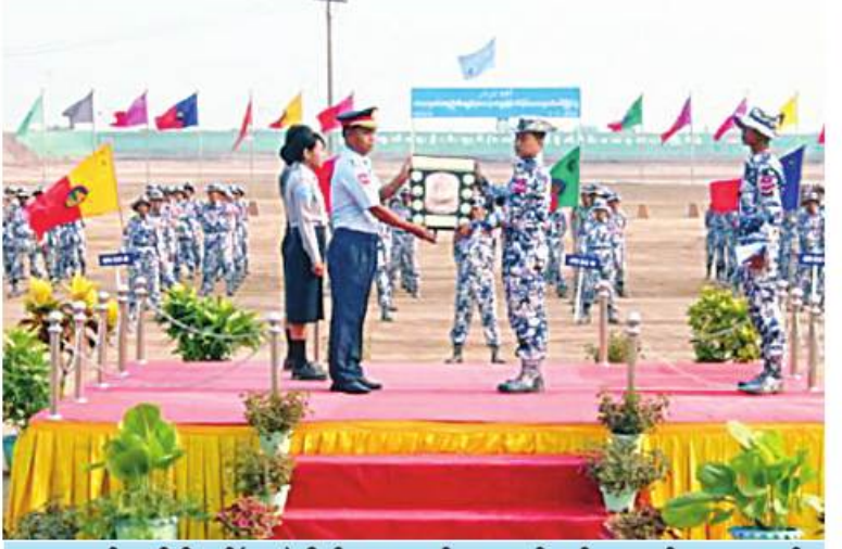
ကာကွယ်ရေးဦးစီးချုပ်(လေ)ကိုယ်စား တောင်ငူလေတပ်စခန်းဌာနချုပ်မှူးက တောင်ငူ လေတပ်စခန်းဌာနချုပ်အသင်းအား တံခွန်စိုက်ခိုင်းဆုနှင့် ဂုဏ်ပြုဆုပေးအပ်ချီးမြှင့်စဉ်။

တောင်ငူလေတပ်စခန်း ဌာနချုပ်အသင်း ကို ကာကွယ်ရေးဦးစီးချုပ်(လေ)ကိုယ်စား တောင်ငူလေတပ်စခန်းဌာနချုပ် ဌာနချုပ်မှူး တလည်းကောင်း တံခွန်စိုက်ခိုင်းဆုနှင့်ဂုဏ်ပြု ဆုများကို အသီးသီးပေးအပ်ချီးမြှင့်ကြသည်။ အဆိုပါ သေနတ်ပစ်ပြိုင်ပွဲတွင် ကာကွယ်ရေးဦးစီးချုပ်(လေ) ကွပ်ကဲမှု အောက် လေတပ်စခန်းဌာနချုပ်၊ လေတပ် စခန်းအသီးသီးမှ ပြိုင်ပွဲဝင်အသင်း ၁၄ သင်းက အမျိုးသား၊ အမျိုးသမီး ပစ္စုပ္ပန်ပစ် ခတ်စဉ်၊ အမျိုးသား၊ အမျိုးသမီး ကာတင် ပစ်ခတ်စဉ်၊ အမျိုးသားရိုင်ဖယ်ပစ်ခတ်စဉ်၊ အမျိုးသားစက်ကလေးပစ်ခတ်စဉ်များကို ဧပြီ ၃ ရက်မှ ယနေ့ထိ ယှဉ်ပြိုင်ပစ်ခတ်ခဲ့ ခြင်းဖြစ်ကြောင်း သတင်းရရှိသည်။