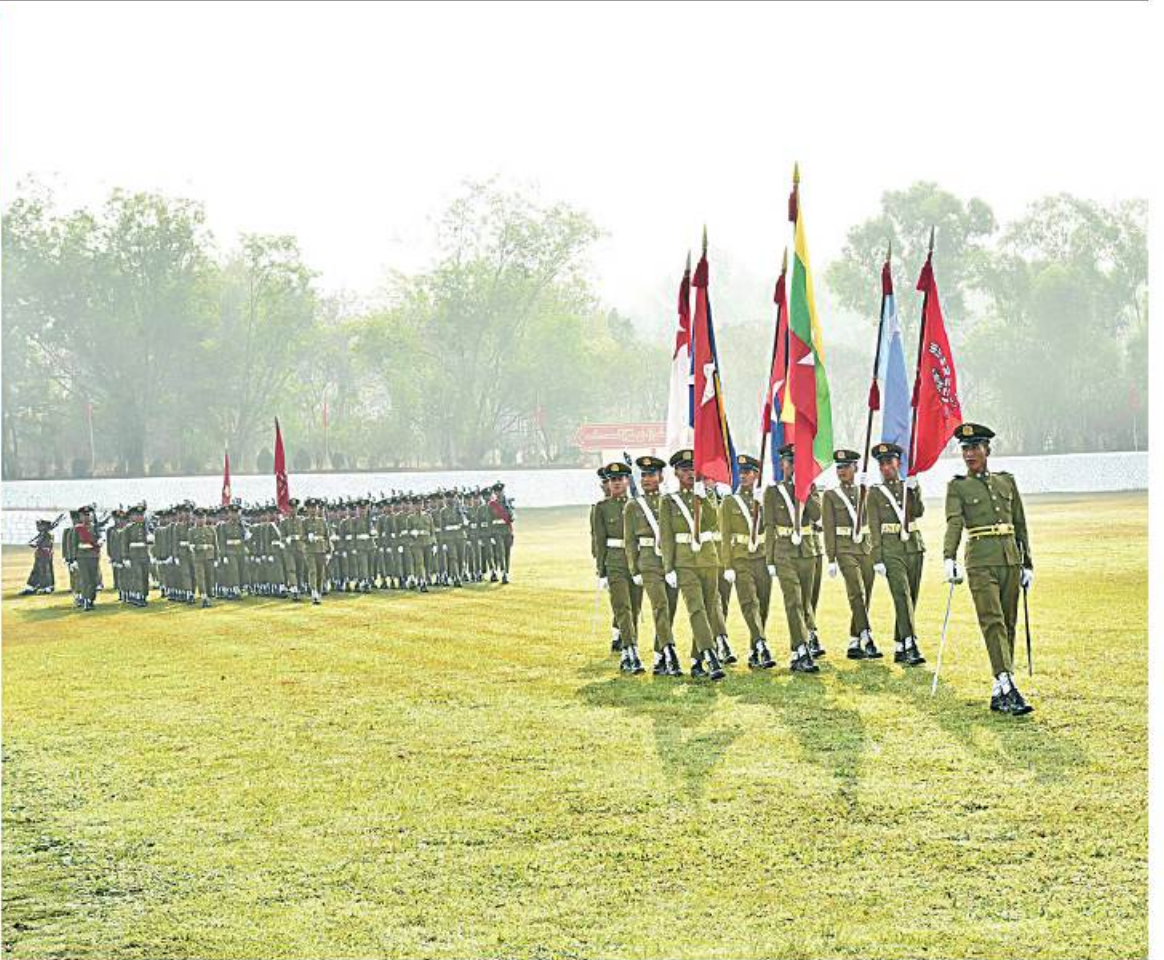
နိုင်ငံတော်စီမံအုပ်ချုပ်ရေးကောင်စီဒုတိယဥက္ကဋ္ဌ ဒုတိယတပ်မတော်ကာကွယ်ရေးဦးစီးချုပ် ကာကွယ်ရေးဦးစီးချုပ်(ကြည်း) ဒုတိယဗိုလ်ချုပ်မှူးကြီး သီရိပျံချီ မဟာသရေစည်သူစိုးဝင်း ကျောင်းဆင်းဗိုလ်လောင်းတပ်ခွဲများ၏ အနားလျှောက်၊ အမြန်လျှောက်ဖြင့် ချီတက်အလေးပြုခြင်းကို ခံယူစဉ်။

ဥပဒေနှင့်ညီညွတ်သည့်အမိန့်၊ မျှတသည့် ဆုံးဖြတ်ချက်များနှင့် မိမိတို့ကွပ်ကဲရသည့် တပ်ဖွဲ့ကို တိုးတက်အောင်မြင်အောင် စနစ်တကျ ဦးဆောင်သွားကြရမှာဖြစ်ကြောင်း။