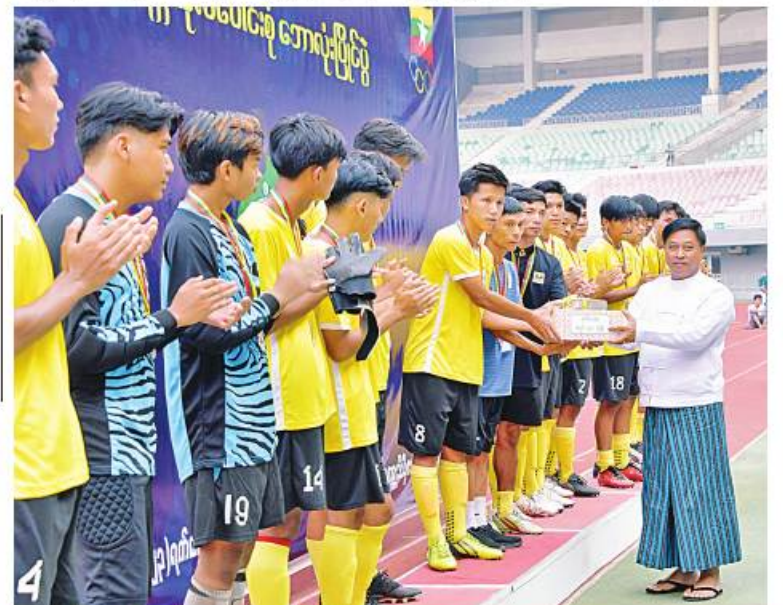
နိုင်ငံတော်စီမံအုပ်ချုပ်ရေးကောင်စီဝင် ဝိုင်းလှည့်မှုကြီးတင်အောင်စန်းက ဒုတိယဆုရရှိ သည့် ကွန်ပျူတာတက္ကသိုလ်(အောက်မြန်မာပြည်) (က)အသင်းကို ဂုဏ်ပြုဆုနှင့်ချီးမြှင့်ငွေ များ ပေးအပ်ချီးမြှင့်စဉ်။