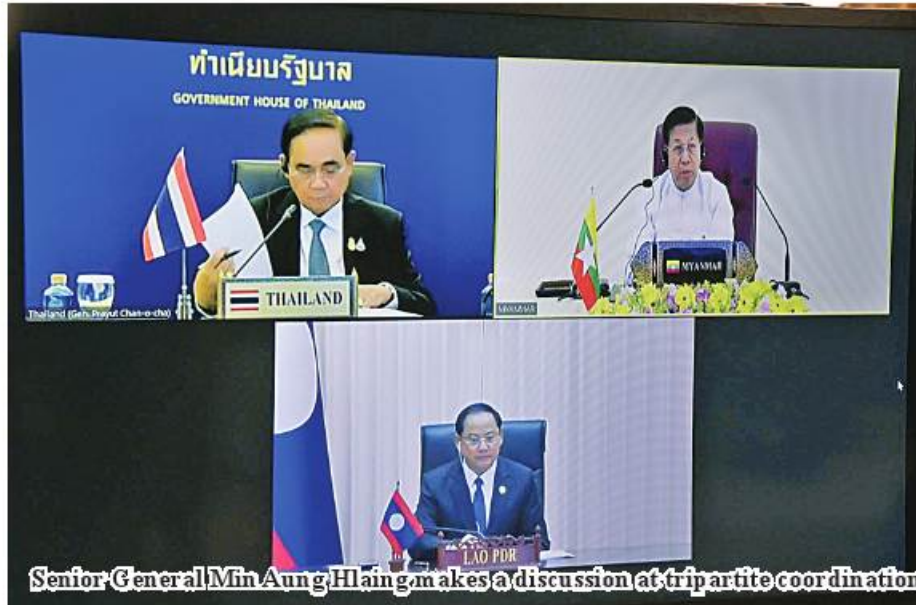
Senior General Min Aung Hlaing makes a discussion at tripartite coordination meeting on Transboundary smog issue.