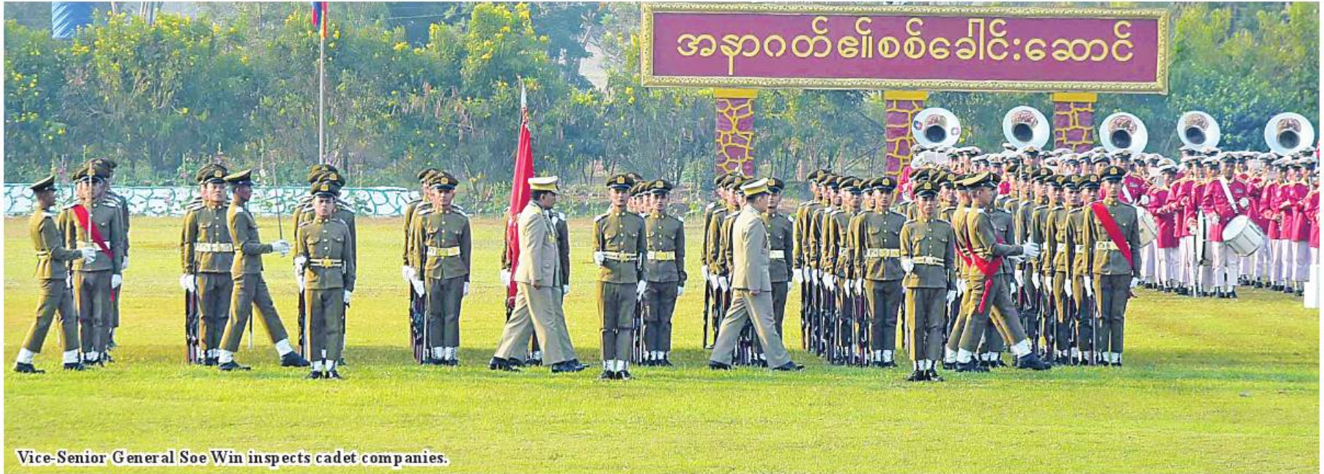
Vice-Senior General Soe Win inspects cadet companies.

Nay Pyi Taw April 7 The passing out parade of the Thura Company's 126 th Intake of Officer Training Course of Tatmadaw (Army) Officer Training School (Bahtoo) was held at the parade ground of the OTS this morning, addressed by Vice Chairman of the State Administration Council Deputy Commander-in-Chief of Defence Services Commander-in-Chief