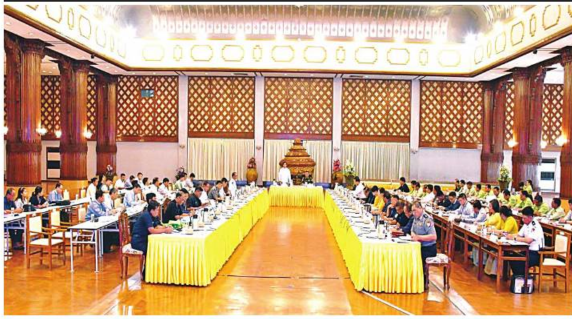
ရန်ကုန်တိုင်းဒေသကြီး ဝန်ကြီးချုပ် ဦးစိုးသိန်း ၂၀၂၃ ခုနှစ် မြန်မာ့ရိုးရာယဉ်ကျေးမှုမဟာသင်္ကြန်ပွဲတော် အောင်မြင်စွာကျင်းပ ပြုလုပ်နိုင်ရေးလုပ်ငန်းညှိနှိုင်းအစည်းအဝေးတွင် အမှာစကားပြောကြားစဉ်။