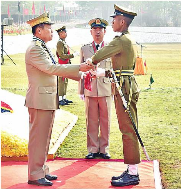
နိုင်ငံတော်စီမံအုပ်ချုပ်ရေးကောင်စီဒုတိယဥက္ကဋ္ဌ ဒုတိယတပ်မတော်ကာကွယ်ရေးဦးစီးချုပ် ကာကွယ်ရေးဦးစီးချုပ်(ကြည်း) ဒုတိယဗိုလ်ချုပ်မှူးကြီး သီရိပျံချီ မဟာသရေစည်သူစိုးဝင်း တပ်မတော်(ကြည်း) ဗိုလ်သင်တန်းကျောင်း(ဗထူး) ဗိုလ်လောင်းသင်တန်းအမှတ်စဉ်(၁၂၆)မှ အကောင်းဆုံးဗိုလ်လောင်းဆုရရှိသူ ဗိုလ်လောင်းအမှတ် ၂ ဗိုလ်လောင်း မောင်မောင်မြင့်မြတ်ကို ငွေစားဆုချီးမြှင့်ပေးအပ်စဉ်။

ကျောပုံးမှအဆက် ဒုတိယတပ်မတော်ကာကွယ်ရေးဦးစီးချုပ် ကာကွယ်ရေးဦးစီးချုပ်(ကြည်း) ဒုတိယဗိုလ်ချုပ်မှူးကြီး သီရိပျံချီ မဟာသရေစည်သူ စိုးဝင်း တက်ရောက်မိန့်ခွန်းပြောကြားသည်။ အဆိုပါ အခမ်းအနားသို့ နိုင်ငံတော် စီမံအုပ်ချုပ်ရေးကောင်စီ ဒုတိယဥက္ကဋ္ဌ ဒုတိယတပ်မတော်ကာကွယ်ရေးဦးစီးချုပ်၏ ဇနီး ဒေါ်သန်းသန်းနွယ်ညွှန်ကွဲကတော်များ (ကြည်း၊ ရေ၊ လေ) ဗိုလ်ချုပ်ကြီး သီရိပျံချီ စည်သူမောင်မောင်အေးနှင့် ဇနီး၊ ရှမ်းပြည်နယ်ဝန်ကြီးချုပ် ဝေယျကျော်ထင် စည်သူ ဦးအောင်ဇော်အေးနှင့် ဇနီး၊ ကာကွယ်ရေးဦးစီးချုပ်ရုံးမှ တပ်မတော်အရာရှိကြီးများ၊ အရှေ့ပိုင်းတိုင်းစစ်ဌာနချုပ် တိုင်းမှူးနှင့် ဇနီး၊ ဗထူးတပ်နယ်မှတပ်မတော်အရာရှိကြီးများနှင့် ဇနီးများ၊ ကျောင်းဆင်းဗိုလ်လောင်းများ၏ မိဘအုပ်ထိန်းသူများဖြစ်သည့် တပ်မတော်(ကြည်း)ဗိုလ်သင်တန်းကျောင်း(ဗထူး)မှ နည်းပြအရာရှိများနှင့် ဆရာ၊ ဆရာမများ၊ ဖိတ်ကြားထားသည့်ညွှန်သည်တော်များ တက်ရောက်ကြသည်။ အခမ်းအနားတွင် နိုင်ငံတော်စီမံအုပ်ချုပ်ရေးကောင်စီ ဒုတိယဥက္ကဋ္ဌ ဒုတိယတပ်မတော်ကာကွယ်ရေးဦးစီးချုပ် ကာကွယ်ရေးဦးစီးချုပ်(ကြည်း) ဒုတိယဗိုလ်ချုပ်မှူးကြီး သီရိပျံချီ မဟာသရေစည်သူ စိုးဝင်းသည် ဗိုလ်လောင်းတပ်ခွဲများ၏