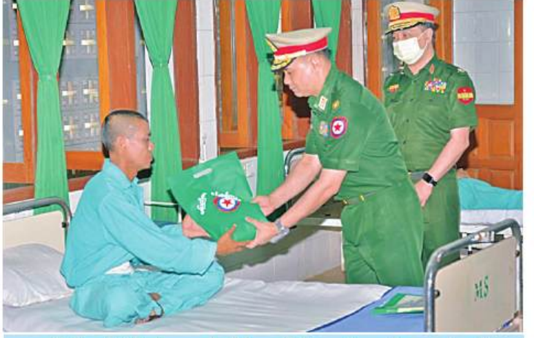
နေပြည်တော်တိုင်းစစ်ဌာနချုပ် တိုင်းမှူး ဝိုလ်ချုပ်ထင်လတ်ဦး ဆေးရုံတက်လူနာ တစ်ဦးကို စားသောက်ဖွယ်ရာများ ပေးအပ်စဉ်။

ဟောင်းအဖွဲ့ဝင်များ၊ ပြည်သူ့စစ်(ဌာနေ) တပ်ဖွဲ့ဝင်များနှင့် ဒေသခံတိုင်းရင်းသား ပြည်သူများကို ယနေ့တွင် သက်ဆိုင်ရာ တိုင်းစစ်ဌာနချုပ်အသီးသီးမှ တိုင်းမှူးများ နှင့်အဖွဲ့ဝင်များက သွားရောက်ကြည့်ရှု၍ တစ်ဦးချင်း၏ ရောဂါဖြစ်ပွားမှု၊ ဆေးဝါး ကုသပေးထားမှုနှင့် ကျန်းမာရေးတိုးတက်မှု အခြေအနေများကို ရင်းရင်းနှီးနှီးမေးမြန်း အားပေးစကားပြောကြားပြီး စားသောက် ဖွယ်ရာများနှင့် ထောက်ပံ့ငွေများပေးအပ် ကြသည်။ ထို့နောက် တိုင်းမှူးများနှင့် အဖွဲ့ဝင် များသည် ဆေးရုံများအတွင်း လှည့်လည် ကြည့်ရှုပြီး လိုအပ်သည်များ ညှိနှိုင်း ဆောင်ရွက်ပေးခဲ့ကြောင်း သတင်း ရရှိသည်။