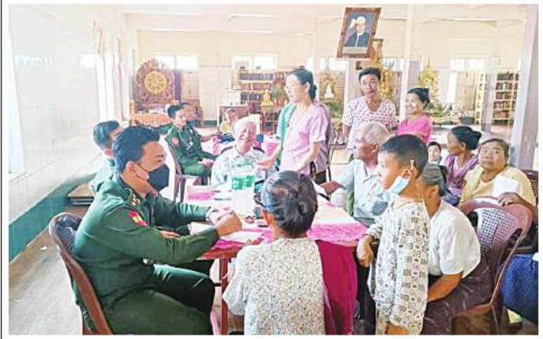
အလယ်ပိုင်းတိုင်းဝန်ဌာနချုပ် နယ်မြေခံဆေးကုသရေးအဖွဲ့က ဒေသခံပြည်သူများကို ကျန်းမာရေးစောင့်ရှောက်မှုလုပ်ငန်းများ ဆောင်ရွက်ပေးခဲ့ပါ။