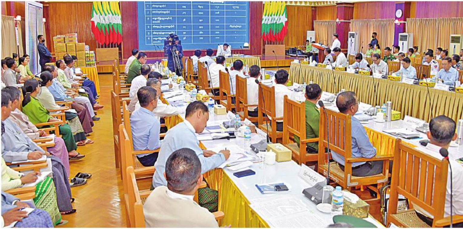
နိုင်ငံတော်စီမံအုပ်ချုပ်ရေးကောင်စီဥက္ကဋ္ဌ နိုင်ငံတော်ဝန်ကြီးချုပ် ဗိုလ်ချုပ်မှူးကြီးမင်းအောင်လှိုင်အား ရခိုင်ပြည်နယ်ဝန်ကြီးချုပ် ဦးထိန်လင်းက ဒေသဆိုင်ရာအချက်အလက်များနှင့် ဒေသဖွံ့ဖြိုးရေးဆောင်ရွက်နေမှုအခြေအနေများကို ရှင်းလင်းတင်ပြစဉ်။

ကျောစုံမှအဆက် အနောက်ပိုင်းတိုင်းစစ်ဌာနချုပ် တိုင်းမှူး ဗိုလ်ချုပ်ထင်လတ်ဦး၊ ရခိုင်ပြည်နယ် အစိုးရအဖွဲ့နှင့် ပြည်နယ်အဆင့် ဌာနဆိုင်ရာတာဝန်ရှိသူများ တက်ရောက်ကြသည်။