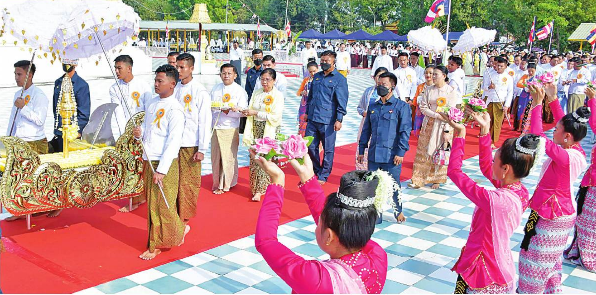
နိုင်ငံတော်စီမံအုပ်ချုပ်ရေးကောင်စီဥက္ကဋ္ဌ နိုင်ငံတော်ဝန်ကြီးချုပ် ဗိုလ်ချုပ်မှူးကြီးမင်းအောင်လှိုင်နှင့် ဇနီး ဒေါ်ကြာကြာလှ၊ အဖွဲ့ဝင်များက ရတနာစိန်ပူးတော်၊ ငှက်မြတ်နားတော်တို့ကို မင်္ဂလာဝေါယာဉ်တော်ဖြင့် ပင့်ဆောင်၍ စေတီတော်မြတ်ကြီးအား လက်ယာရစ်လှည့်လည်ပူဇော်စဉ်။

နေပြည်တော် မတ် ၃၁ ပုဒ္ဓါဘိသေကအနေကဇာတင် မဟာမင်္ဂလာအခမ်းအနားကို ယနေ့နံနက်ပိုင်းတွင် ကျင်းပပြုလုပ်ရာ နိုင်ငံတော်သံယမဟာနာယကအဖွဲ့ တွဲဖက်အကျိုးတော်ဆောင် မင်းပြားမြို့ ပရိယတ္တိဓမ္မိကာရာမစာသင်တိုက်ပဓာနနာယက အဂ္ဂမဟာသဒ္ဓမ္မ ချီးမြှင့်တော်မူကြသည်။ ရခိုင်ပြည်နယ် စစ်တွေမြို့ ကျက်သရေဆောင် လောကနန္ဒာစေတီတော်မြတ်ကြီးအား ရတနာစိန်ပူးတော်၊ ငှက်မြတ်နားတော်တင်လှူပူဇော်ပွဲနှင့် တော်ဆောင် မင်းပြားမြို့ ပရိယတ္တိဓမ္မိကာရာမစာသင်တိုက်ပဓာနနာယက အဂ္ဂမဟာဂန္ထဝါစကပဏ္ဍိတ ဘဒ္ဒန္တကုန္ဒာစရိယ မင်းပြားဆရာတော်ကြီး အဖွဲ့ဖြင့်လှူပူသည့် ရတနာစိန်ပူးတော်၊ ငှက်မြတ်နားတော်အရှင်သူမြတ်များကြွရောက်အဆိုပါအခမ်းအနားသို့ နိုင်ငံတော်စီမံအုပ်ချုပ်ရေးကောင်စီဥက္ကဋ္ဌ နိုင်ငံတော်ဝန်ကြီးချုပ် စာမျက်နှာ ၁၆ ကော်လံ ၁ P။