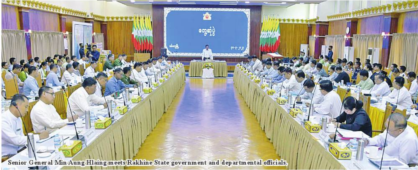
Senior General Min Aung Hlaing meets Rakhine State government and departmental officials.