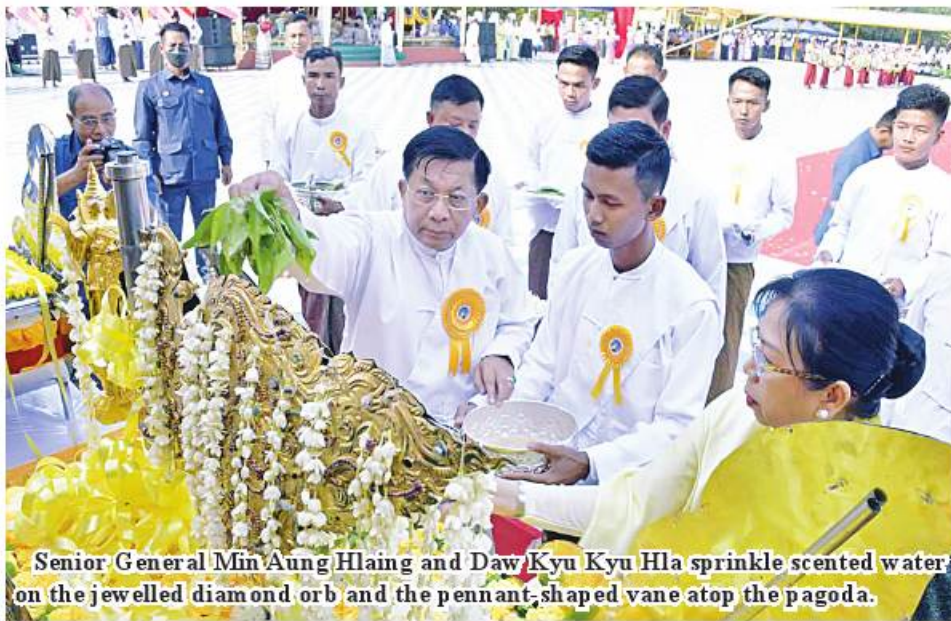
Senior General Min Aung Hlaing and Daw Kyu Kyu Hla sprinkle scented water on the jewelled diamond orb and the pennant-shaped vane atop the pagoda.