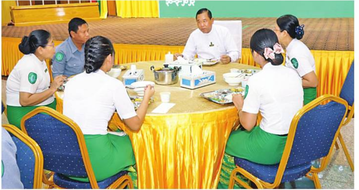
ပြည်ထောင်စုဝန်ကြီး ဒုတိယဗိုလ်ချုပ်ကြီးထွန်းထွန်းနောင် နယ်စပ်ရေးရာဝန်ကြီးဌာန ဝန်ထမ်းမိသားစုများ၏ ဆဋ္ဌမအကြိမ် မိတ်ဆုံစားပွဲတွင် ဝန်ထမ်းများနှင့်အတူ နေ့လယ်စာအတူတကွသုံးဆောင်စဉ်။

အဆိုပါ မိတ်ဆုံနေ့လယ်စာစားပွဲသို့ ပြည်ထောင်စုဝန်ကြီး ဒုတိယဗိုလ်ချုပ်ကြီး ထွန်းထွန်းနောင်၊ ဒုတိယဝန်ကြီး ဗိုလ်ချုပ် ခွန်သန့်ဇော်ထူးနှင့် ဗိုလ်ချုပ်ပြုံးသန်း၊ အမြဲတမ်းအတွင်းဝန်၊ ညွှန်ကြားရေးမှူးချုပ်၊ ဌာနအကြီးအကဲများ၊ ဝန်ကြီးရုံးနှင့် ဦးစီးဌာနများမှ အရာထမ်း၊ အမှုထမ်းများ တက်ရောက်၍ ရင်းနှီးခင်မင်စွာ လက်ရည် တစ်ပြင်တည်း သုံးဆောင်ခဲ့ကြကြောင်း သတင်းရရှိသည်။ (သတင်းစဉ်)