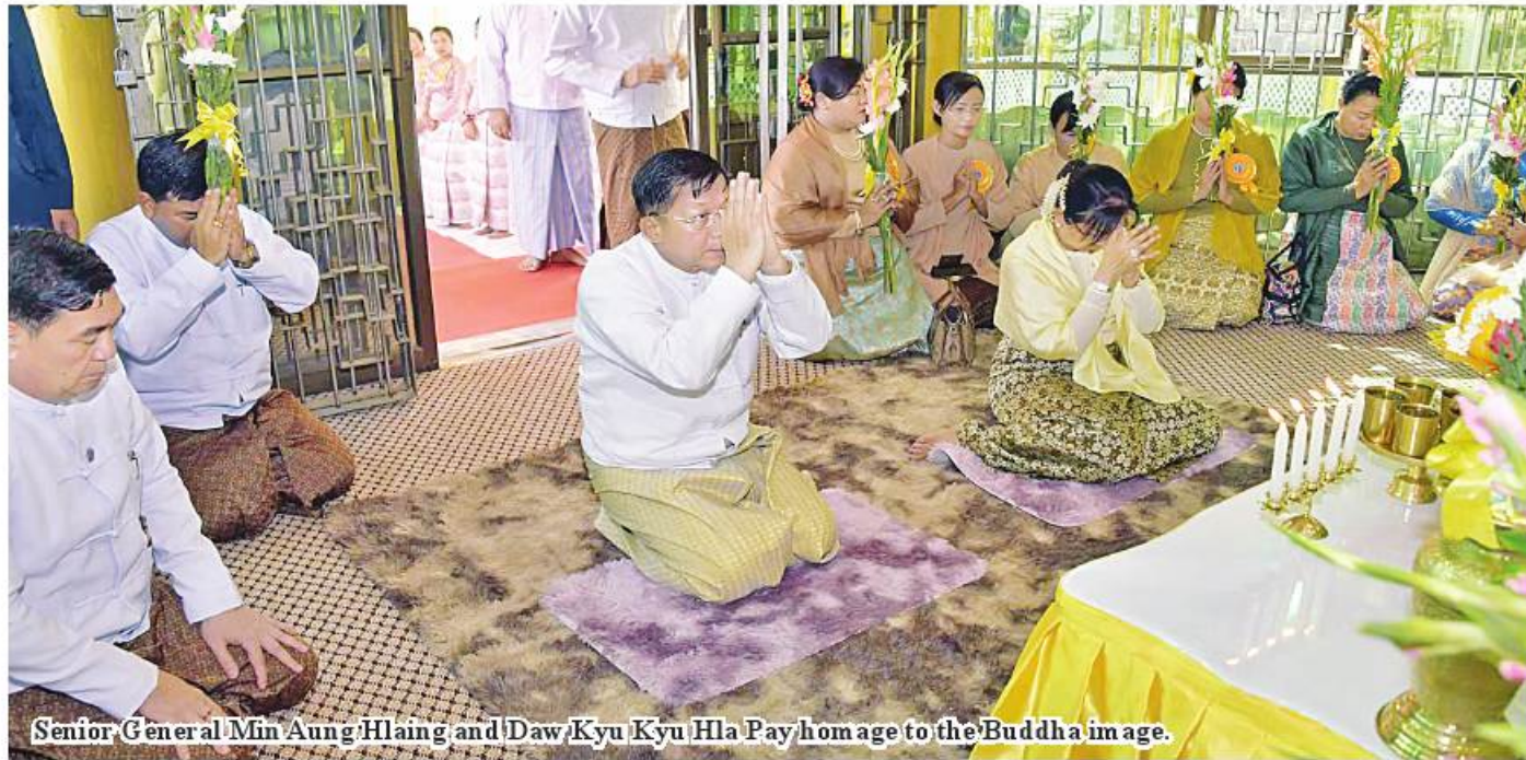
Senior General Min Aung Hlaing and Daw Kyu Kyu Hla Pay homage to the Buddha image.

The Senior General, wife and party paid homage to the Cakkamuni Buddha image in the Cakkamuni ordination hall, offered alms in the emerald alms bowl, flowers, water and