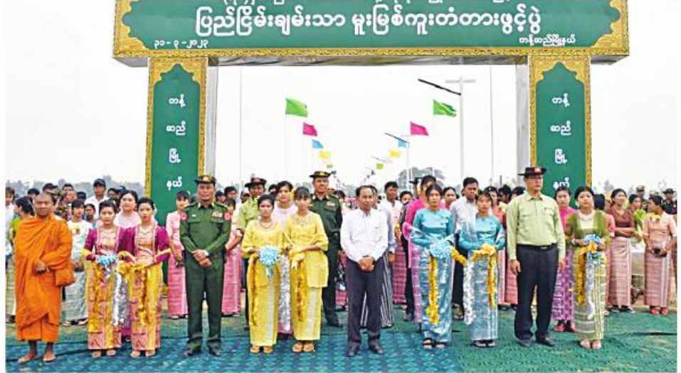
စစ်ကိုင်းတိုင်းဒေသကြီးဝန်ကြီးချုပ် ဦးမြတ်ကျော်၊ အနောက်မြောက်တိုင်းစစ်ဌာနချုပ် တိုင်းမှူး ဗိုလ်ချုပ်သန်းထိုက်နှင့် တာဝန်ရှိသူများက ပြည်ငြိမ်းချမ်းသာမူးမြစ်ကူးတံတားကို ဖဲကြိုးဖြတ်ဖွင့်လှစ်ပေးစဉ်။