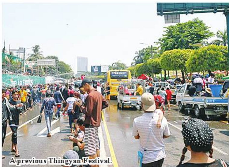
A previous Thingyan Festival.