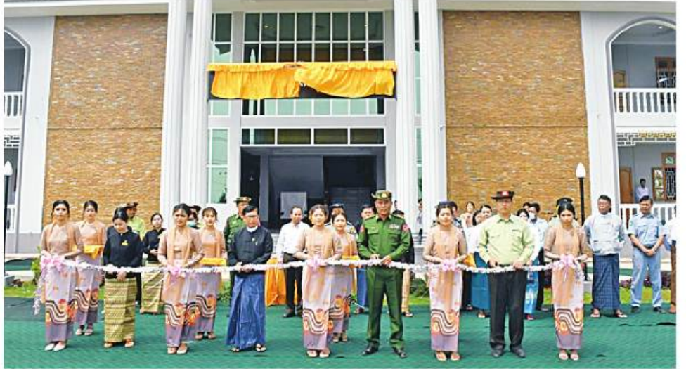
စစ်ကိုင်းတိုင်းဒေသကြီးဝန်ကြီးချုပ် ဦးမြတ်ကျော်၊ အနောက်မြောက်တိုင်းစစ်ဌာနချုပ် တိုင်းမှူး ဗိုလ်ချုပ်သန်းထိုက်နှင့် တာဝန်ရှိသူများက ကန့်ဘလူခရိုင်တရားရုံးနှင့် မြို့နယ်တရားရုံးကို ဖဲကြိုးဖြတ်ဖွင့်လှစ်ပေးစဉ်။

နေပြည်တော် မတ် ၃၁ စစ်ကိုင်းတိုင်းဒေသကြီး ကန့်ဘလူ ခရိုင် ကန့်ဘလူမြို့နယ် ညောင်ပင်ကြီး ကျေးရွာအုပ်စု မိုးကောင်းကျေးရွာနှင့် ရေဦးခရိုင် တန့်ဆည်မြို့နယ် ကျွန်းလည် ကျေးရွာတို့ကိုဆက်သွယ်သည့် ပြည်ငြိမ်း ချမ်းသာ မူးမြစ်ကူးတံတားဖွင့်ပွဲကို ယနေ့ နံနက်ပိုင်းတွင် အဆိုပါ မူးမြစ်ကူးတံတား မှုဒ်ဦးရွှေ၌ပြုလုပ်ရာ စစ်ကိုင်းတိုင်းဒေသ ကြီးဝန်ကြီးချုပ် ဦးမြတ်ကျော်၊ အနောက် မြောက်တိုင်းစစ်ဌာနချုပ် တိုင်းမှူး ဗိုလ်ချုပ်