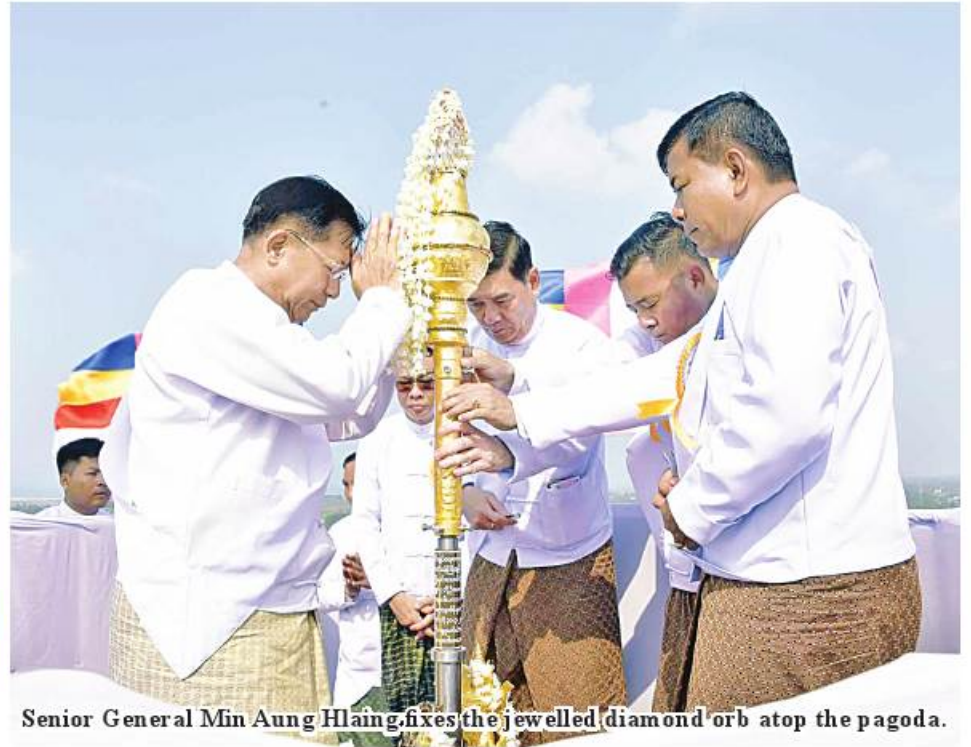
Senior General Min Aung Hlaing fixes the jewelled diamond orb atop the pagoda.