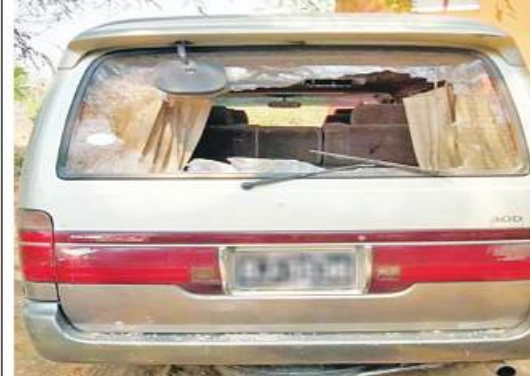
နွားထိုးကြီး-မြင်းခြံသွား ကားလမ်း၌ PDF အမည်ခံ အကြမ်းဖက်သမားများ ထောင်ထားသည့် မိုင်းတစ်လုံး ပေါက်ကွဲခဲ့မှုကြောင့် မော်တော်ယာဉ် ပျက်စီးခဲ့မှု မှတ်တမ်းဓာတ်ပုံ။

နေပြည်တော် မတ် ၃၁ ယာဉ်သည် လျော်ဖြူကျေးရွာ၏ အနောက် မြောက်ဘက် မီတာ ၈၀၀ ခန့်အကွာသို့ မြို့နယ် လျော်ဖြူကျေးရွာ၏ အနောက် မြောက်ဘက် မီတာ ၈၀၀ ခန့်အကွာ နွားထိုးကြီး-မြင်းခြံသွား ကားလမ်းဘက် ၁၅ ပေခန့်အကွာ၌ ယနေ့ညနေ ၃ နာရီခွဲခန့်တွင် PDF အမည်ခံ အကြမ်းဖက်သမားများက လက်လုပ်အဝေးထိန်းမိုင်း တစ်လုံး ဖောက်ခွဲခဲ့မှုကြောင့် အပြစ်မဲ့ပြည်သူ တစ်ဦး ဒဏ်ရာရရှိခဲ့ကြောင်း သိရသည်။ အဆိုပါ နေရာတစ်ဝိုက်အား လုံခြုံရေး တပ်ဖွဲ့ဝင်များက လိုအပ်သည့် နယ်မြေလုံခြုံရေးလုပ်ငန်းများ ဆောင်ရွက်လျက်ရှိကြောင်းနှင့် ဒဏ်ရာရရှိသူများကို နွားထိုးကြီးမြို့နယ် ပြည်သူ့ဆေးရုံသို့ ပို့ဆောင် ဆေးကုသမှုခံယူစေလျက်ရှိကြောင်း သတင်း ရရှိသည်။ မြစ်စဉ်မှာ နွားထိုးကြီးမြို့နယ် ဝက်လူးကျေးရွာ၌ ဘုန်းကြီးကျောင်းဓမ္မာရုံ ရေစက်ချပွဲမှ မင်းဘူးမြို့သို့ ပြန်လည်မောင်းနှင်လာသော ဝိတစက်ပိုင်း တေးဂီတအဖွဲ့သား ၁၀ ဦး လိုက်ပါလာသည့် Super Custom အမျိုးအစား မော်တော်