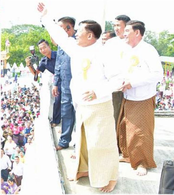
နိုင်ငံတော်စီမံအုပ်ချုပ်ရေးကောင်စီဥက္ကဋ္ဌ နိုင်ငံတော်ဝန်ကြီးချုပ် ဗိုလ်ချုပ်မှူးကြီးမင်းအောင်လှိုင်က စစ်တွေမြို့ လောကာနန္ဒာစေတီတော်မြတ်ကြီး ရတနာစိန်ဖူးတော်၊ ငှက်မြတ်နားတော် တင်လှူပူဇော်အောင်မြင်ခြင်းအထိမ်းအမှတ်အဖြစ် ရတနာရွှေမိုး၊ ငွေမိုးများ ရွာသွန်းပြီးစဉ်။

မြောက်စွာထွင်းထုထားရှိကြောင်း၊ လိုဏ်ဂူ တော်အတွင်းတွင် အရပ်လေးမျက်နှာသို့ မျက်နှာမူနေသည့် ကကုသန်ဘုရား၊ ကောဏဂုံဘုရား၊ ကသပဘုရား၊ ဂေါတမ ဘုရားရှင်တို့၏ ကြေးသွန်းဆင်းတုတော် လေးဆူမှာ ရခိုင်ရှေးခေတ်လက်ရာ ပုံစံများ ဖြင့်ထုဆစ်ထားသည့် ကျောက်သားပလ္လင် များပေါ်တွင် သပ္ပာယ်စွာကိန်းလင်စံပယ်တော် မူလျက်ရှိကြောင်း၊ စေတီတော်ကြီးကို နိုင်ငံတော်အစိုးရ တပ်မတော်၊ ဒေသခံ တိုင်းရင်းသားပြည်သူများ၊ စေတနာရှင် အလှူရှင်များက ခေတ်အဆက်ဆက်ပြုပြင် မွမ်းမံထိန်းသိမ်းခဲ့ကြကြောင်း၊ ယခုအခါ တွင်လည်း စေတီတော်မြတ်ကြီး ရေရှည် တည်တံ့ခိုင်မြဲရေးအတွက် နိုင်ငံတော်စီမံ အုပ်ချုပ်ရေးကောင်စီဥက္ကဋ္ဌ နိုင်ငံတော် ဝန်ကြီးချုပ်အမှူးပြုသည့် ခုနစ်ရက် သား သမီး စေတနာရှင်အလှူရှင်များစုပေါင်း၍ စေတီတော်ကြီးအတွင်း လိုဏ်အပါအဝင် ဘက်စုံ ပြုပြင်မွမ်းမံခဲ့ကြခြင်းဖြစ်ကြောင်း နှင့် ရတနာစိန်ဖူးတော်၊ ငှက်မြတ်နားတော် တင်လှူပူဇော်ပွဲနှင့် ဗုဒ္ဓါဘိသေက အနေ ကလောင် မဟာမင်္ဂလာအခမ်းအနားကို ယနေ့တွင် အောင်မြင်စွာကျင်းပပြုလုပ်နိုင် ခဲ့ခြင်းဖြစ်ကြောင်း သတင်းရရှိသည်။