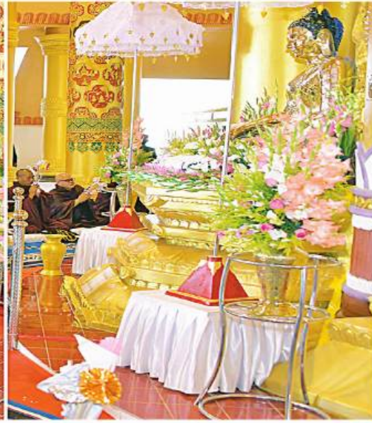
ရခိုင်ပြည်နယ် စစ်တွေမြို့ကျက်သရေဆောင် လောကာနန္ဒာစေတီတော်မြတ်ကြီးအား သံဃာတော်အရှင်သူမြတ်များက ဗုဒ္ဓါဘိသေကအနေကစာတင်၍ ဗုဒ္ဓါဘိသိက်သွန်းတော်မူကြစဉ်။

ဆောင်ရွက်ခဲ့ကာ ၁၉၉၉ ခုနှစ် ဖေဖော်ဝါရီ ၂၈ ရက်တွင် ရွှေထီးတော်တင်မဟာမင်္ဂလာ အခမ်းအနားနှင့် မတ် ၂ ရက်တွင် စေတီတော်ကြီး အနေကစာတင်အခမ်းအနား တို့ကို ကျင်းပပြုလုပ်ပြီးခဲ့ကြောင်း၊ “လောကာ နန္ဒာ” ဟူသည့်အဓိပ္ပာယ်မှာ လူ့လောက၊ နတ် လောက၊ ဗြဟ္မာလောကတို့၏ ကိုးကွယ် ဆည်းကပ်ပူဇော်ရာဟူ၍ အဓိပ္ပာယ်ရကြောင်း နှင့် စေတီတော်ကြီးမှာ ဉာဏ်တော်အမြင့် ၁၀၈ တောင်၊ ပေအားဖြင့် ၁၆၂ ပေ၊ အချင်း ၂၃၂ ပေ၊ ရင်ပြင်တော်အကျယ် ၄၅၉ ပေရှိပြီး အရံစေတီတော် ရှစ်ဆူရှိ ကြောင်း၊ စေတီတော်၏ မုခ်ပေါက်လေးဖက် ကို ရှေးဟောင်းရေခိုင်လက်ရာပုံစံများနှင့် ကျောက်ကိုထွင်းဆစ်ပြုလုပ်ထားပြီး အတွင်း နံရံလေးဖက်တွင် ဗုဒ္ဓမြတ်စွာဘုရား၏ ဖြစ်တော်မူခဲ့ ၅၅၀ ဇာတ်နိပါတ်တော်များကို မြန်မာမူပုံနိပါတ်မဟာလင်္ကာ ရုပ်လုံး၊ ရုပ်ကြွ များဖြင့် ကျောက်ဆစ်အနုလက်ရာပြောင်