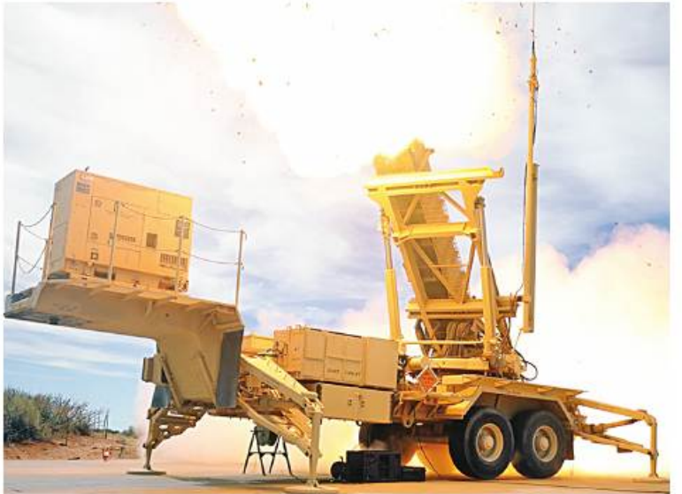
၁၉၉၁ ပင်လယ်ကွေ့စစ်ပွဲတွင် ပထမဆုံး အသုံးပြုခဲ့သည်။ RAYTHEON AWARDED $1.2B US ARMY PATRIOT MISSILE SYSTEM CONTRACT ကို ဘာသာပြန်ဆိုထားပါသည်။

တိုက်ပွဲဝင်ထိန်းချုပ်ရေးယာဉ် တစ်စီးနှင့် ထိုယာဉ်တွင် ခုံးကျည်လေးစင်း ပစ်ခတ်ရန် အသင့်တပ်ဆင်ထားသော လောင်ချာ ရှစ်ခုထိ ပါဝင်ပွဲစည်းထားသည်။ Patriot ခုံးခွင်းခုံးစနစ်သည် အသုံးပြု သောကြားဖြတ်ကိရိယာ(ခုံးကျည်)အမျိုး အစားများပေါ်မူတည်၍ စွမ်းဆောင်ရည် ကွဲပြားသည်။ ၎င်း၏ PAC-2 ကြားဖြတ်ကိရိယာ (ခုံးကျည်)သည် Blast-Fragmentation ခုံးထိပ်ဖူးကို အသုံးပြုထားပြီး နောက်ဆုံး ပေါ် PAC-3 ခုံးကျည်သည် ပိုမိုအဆင့်မြင့် သော ထိကွဲ Hit-to-Kill နည်းပညာကို အသုံးပြုထားသည်။ အဆိုပါခုံးကျည်ကို ဆော်ဒီအာရေဗျ၊ အစ္စရေးနှင့် ကူဝိတ်နိုင်ငံတို့ကို အီရတ်၏ လေကြောင်းတိုက်ခိုက်မှုမှ ကာကွယ်ရန်