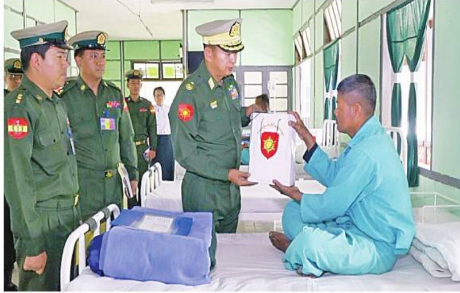
အရှေ့မြောက်တိုင်း ဝန်ဌာနချုပ် တိုင်းမှူး ဝိုင်းချုပ် နိုင်နိုင်ဦး ဆေးကုသမှု ခံယူနေသူ တစ်ဦးကို စားသောက်ဖွယ်ရာများနှင့် ထောက်ပံ့ငွေများ ပေးအပ်ခဲ့ပါ။