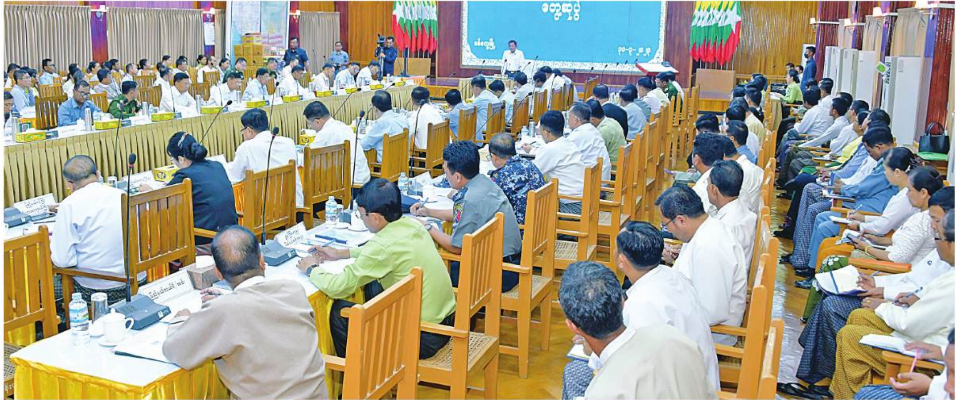
နိုင်ငံတော်စီမံအုပ်ချုပ်ရေးကောင်စီဥက္ကဋ္ဌ နိုင်ငံတော်ဝန်ကြီးချုပ် ဗိုလ်ချုပ်မှူးကြီးမင်းအောင်လှိုင် ရခိုင်ပြည်နယ်အစိုးရအဖွဲ့နှင့် ပြည်နယ်အဆင့် ဌာနဆိုင်ရာတာဝန်ရှိသူများကို တွေ့ဆုံအမှာစကားပြောကြားစဉ်။

နေပြည်တော် မတ် ၃၁ ရခိုင်ပြည်နယ်အစိုးရအဖွဲ့နှင့် ပြည်နယ်အဆင့် ဌာနဆိုင်ရာတာဝန်ရှိသူများကို တွေ့ဆုံအမှာစကားပြောကြားသည်။ အဆိုပါတွေ့ဆုံပွဲသို့ နိုင်ငံတော်စီမံအုပ်ချုပ်ရေးကောင်စီဥက္ကဋ္ဌ နိုင်ငံတော်ဝန်ကြီးချုပ်နှင့်အတူ ကောင်စီတွဲဖက်အဖွဲ့ဝင်များ၊ ဒုတိယဗိုလ်ချုပ်ကြီးရဲဝင်းဦး၊ ကောင်စီဝင်များ၊ ပြည်ထောင်စုဝန်ကြီးများ၊ ရခိုင်ပြည်နယ်ဝန်ကြီးချုပ် ဦးထိန်လင်း၊ ညိုနှိုင်းကွပ်ကဲရေးမှူး (ကြည်း၊ ရေ၊ လေ)နှင့် ကာကွယ်ရေးဦးစီးချုပ်ရုံးမှ တပ်မတော်အရာရှိကြီးများ၊ စာမျက်နှာ ၁၉ ကော်လံ ၁ ☆