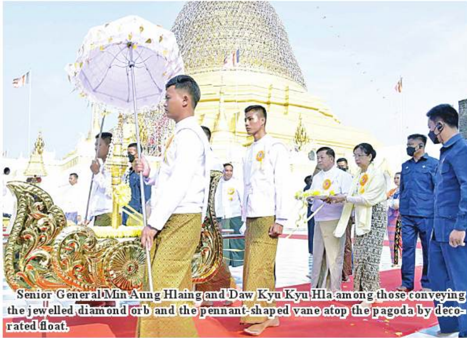
Senior General Min Aung Hlaing and Daw Kyu Kyu Hla among those conveying the jewelled diamond orb and the pennant-shaped vane atop the pagoda by decorated float.

Nay Pyi Taw March 31 held in conjunction with the consecration in Sittway of Rakhine State this morning, attended by Joint Secretary of the State Sangha Maha Nayaka Committee Presiding Patron of Pariyatti Dhammikarama Buddhist Learning Centre in Minbya Agga Maha Saddhamma Jo-