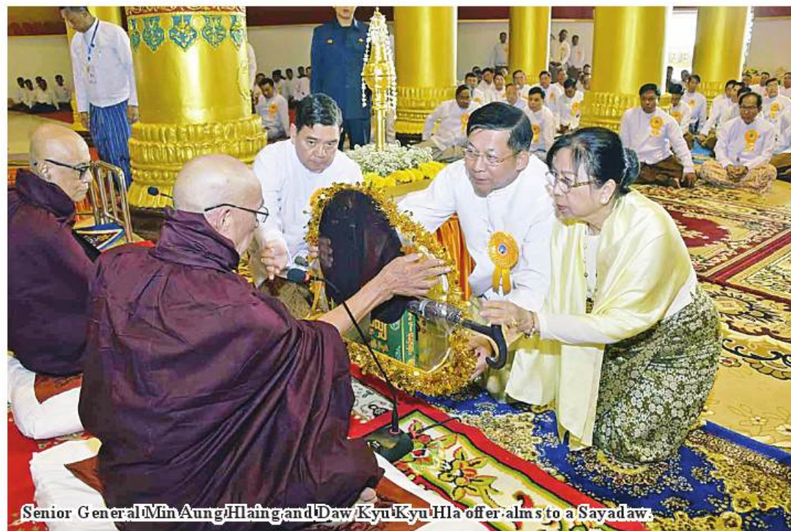
Senior General Min Aung Hlaing and Daw Kyu Kyu Hla offer alms to a Sayadaw.

oil light and gave instructions on the long-term existence of the image and beatifying tasks to officials.