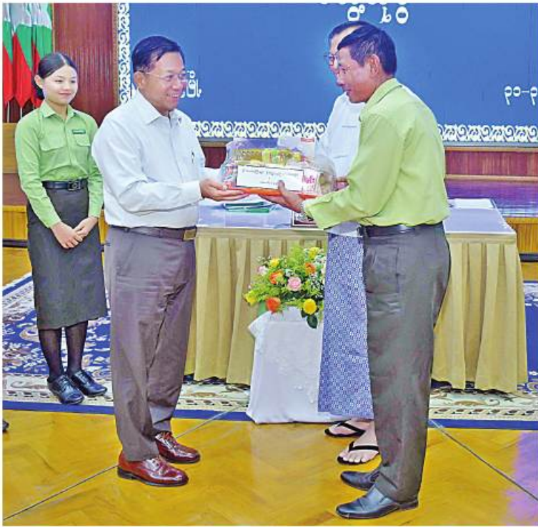
နိုင်ငံတော်စီမံအုပ်ချုပ်ရေးကောင်စီဥက္ကဋ္ဌ နိုင်ငံတော်ဝန်ကြီးချုပ် ဗိုလ်ချုပ်မှူးကြီး မင်းအောင်လှိုင်က ရခိုင်ပြည်နယ်အစိုးရအဖွဲ့နှင့် ပြည်နယ်အဆင့်ဌာနဆိုင်ရာ ဝန်ထမ်းများအတွက် စားသောက်ဖွယ်ရာများကို ထောက်ပံ့ပေးအပ်စဉ်။