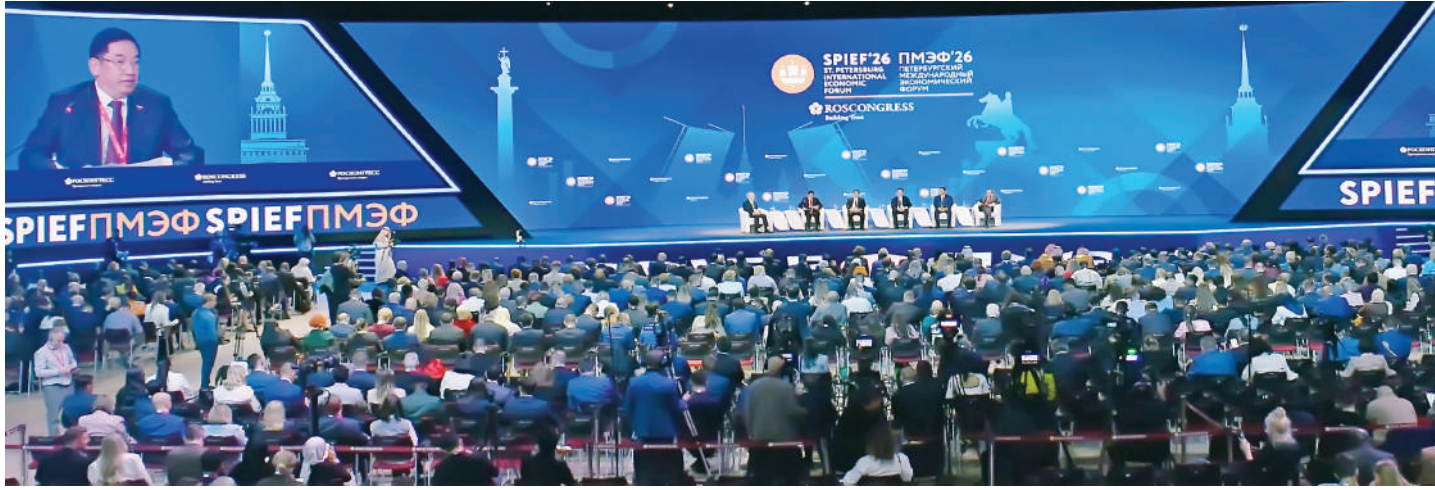
ပြည်ထောင်စုသမ္မတမြန်မာနိုင်ငံတော် ဒုတိယသမ္မတ ဦးညိုစော ၂၉ ကြိမ်မြောက် နိုင်ငံတကာစီးပွားရေးဖိုရမ်(29 th St. Petersburg International Economic Forum- SPIEF 2026) ဖွင့်ပွဲအခမ်းအနားတွင် ဆွေးနွေးပြောကြားစဉ်။

နေပြည်တော် ဇွန် ၄ ၂၉ ကြိမ်မြောက် နိုင်ငံတကာစီးပွားရေးဖိုရမ် (29 th St. Petersburg International Economic Forum-SPIEF 2026) ဖွင့်ပွဲအခမ်းအနားကို ယနေ့ Centre ဌာန ကျင်းပရာ ဒုတိယသမ္မတ ဦးညိုစော ဒေသစံတော်ချိန် မွန်းလွဲပိုင်းတွင် စိန့်ပီတာစဘတ် တက်ရောက်ဆွေးနွေးပြောကြားသည်။ မြို့ရှိ EXPOFORUM Convention and Exhibition စာမျက်နှာ ၁၈ ကော်လံ ၁ ☆