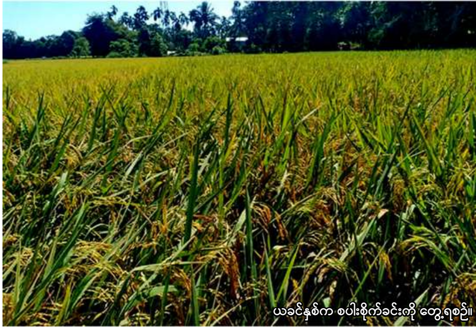
ယခင်နှစ်က စပါးစိုက်ခင်းကို တွေ့ရစဉ်။

ဘုတလင် ဇွန် ၄ စစ်ကိုင်းတိုင်းဒေသကြီး မှု ရှာ ခရိုင် ဘုတလင်မြို့နယ်တွင် ယခုနှစ် မိုးသီးနှံစိုက်ပျိုးရာသီ၌ စပါး ၃၄၅၆၆ ဧက စိုက်ပျိုးမည်ဖြစ်ကြောင်း ဘုတလင်မြို့နယ်စိုက်ပျိုးရေးဦးစီးဌာနမှ သိရသည်။