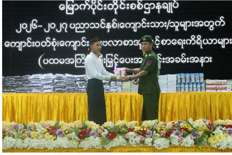
မြောက်ပိုင်းတိုင်းစစ်ဌာနချုပ် ၂၀၂၆-၂၀၂၇ ပညာသင်နှစ်၊ကျောင်းသား/သူများအတွက် ကျောင်းဝတ်စုံ၊ကျောင်းသုံးပလာစတစ်အုပ်နှင့် စာရေးကိရိယာများ (ပထမအကြိမ်) ချီးမြှင့်ပေးအပ်ခြင်းအခမ်းအနား