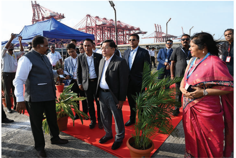
နိုင်ငံတော်သမ္မတ ဦးမင်းအောင်လှိုင် မွမ်ဘိုင်းမြို့၊ ဂျပါဟာလာနေရှူးဆိပ်ကမ်း(JNPA)အတွင်း ဇွန်လ ၂ ရက်နေ့က ကြည့်ရှုလေ့လာစဉ်။

နိုင်ငံတော်သမ္မတကြီးဦးဆောင်တဲ့ မြန်မာ အဆင့်မြင့်ကိုယ်စားလှယ်အဖွဲ့ဟာ ညနေပိုင်းမှာ မွမ်ဘိုင်းမြို့ရဲ့ အရှေ့ဘက်၊ နာဗာရီဗာ ဒေသမှာရှိတဲ့ ဂျပါဟာလာနေရှူးဆိပ်ကမ်း(JNPA)ကိုသွားရောက် လေ့လာခဲ့ပါတယ်။ နိုင်ငံတော်သမ္မတကြီးဦးဆောင် တဲ့မြန်မာအဆင့်မြင့်ကိုယ်စားလှယ်အဖွဲ့ကို ဆိပ်ကမ်း အာဏာပိုင်အဖွဲ့ဥက္ကဋ္ဌနဲ့ တာဝန်ရှိသူတွေက ဆိပ်ကမ်းအစည်းအဝေးခန်းမမှာ ဆိပ်ကမ်းဆိုင်ရာ အချက်အလက်တွေနဲ့ ဆိပ်ကမ်းရဲ့ စွမ်းဆောင်နိုင်မှု အခြေအနေတွေကို Power Point တွေ၊ မှတ်တမ်း စီဒီယိုတွေနဲ့ ပြည့်ပြည့်စုံစုံ ရှင်းလင်းတင်ပြခဲ့ကြပါ တယ်။ ဒီလိုရှင်းလင်းပြသတဲ့အချိန်မှာလည်း ဆိပ်ကမ်း ဥက္ကဋ္ဌနဲ့ တာဝန်ရှိသူတွေက နိုင်ငံတော်သမ္မတကြီး ဦးဆောင်တဲ့ မြန်မာအဆင့်မြင့် ကိုယ်စားလှယ်အဖွဲ့ ကို လှိုက်လှဲနွေးထွေးစွာနဲ့ ကြိုဆိုကြောင်း၊ မြန်မာ