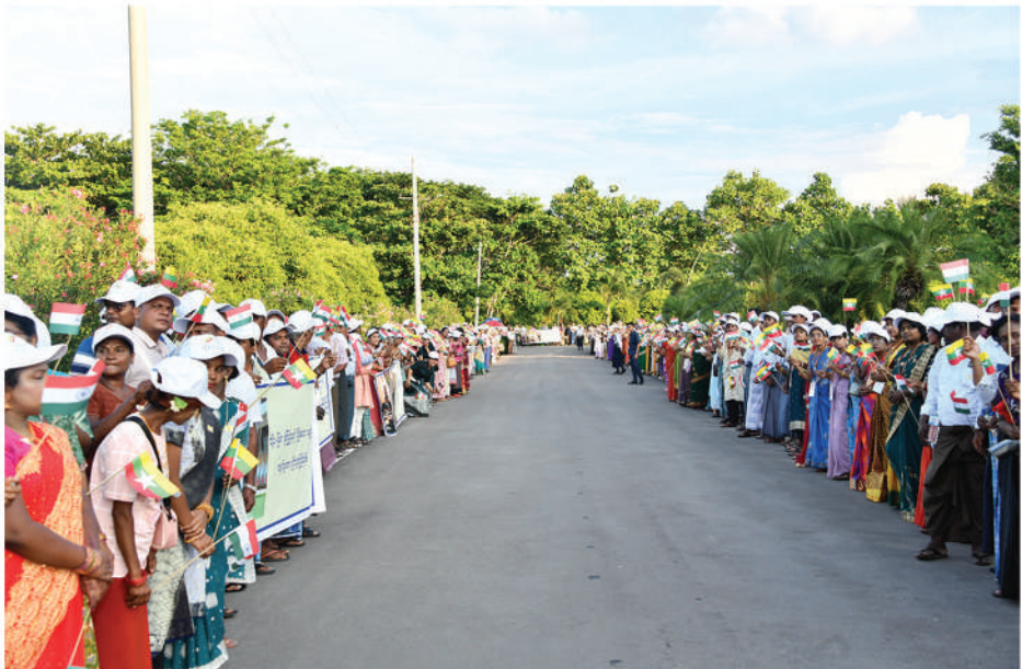
ဇွန် ၃ ရက်က အိန္ဒိယနိုင်ငံမှပြန်လည်ရောက်ရှိလာသည့် ပြည်ထောင်စုသမ္မတမြန်မာနိုင်ငံတော် နိုင်ငံတော်သမ္မတ ဦးမင်းအောင်လှိုင် ဦးဆောင်သည့် မြန်မာအဆင့်မြင့်ကိုယ်စားလှယ်အဖွဲ့အား ဒေသခံပြည်သူများက ပြည်ထောင်စုသမ္မတမြန်မာနိုင်ငံတော် အလံနှင့် အိန္ဒိယသမ္မတနိုင်ငံအလံတို့ကို ကိုင်ဆောင်ဝေ့ယမ်းကာ သောင်းသောင်းဖြဖြ ကြိုဆိုဂုဏ်ပြုနှုတ်ဆက်ကြစဉ်။

နိုင်ငံတော်သမ္မတကြီးက အဖွင့်အမှာစကား ပြောကြားရာမှာ နှစ်နိုင်ငံကုန်းမြေနှင့် ရေကြောင်း နယ်နိမိတ်များ ထိစပ်နေသည့်အပြင် ယခုအချိန် သည် စီးပွားရေး၊ ကုန်သွယ်မှုနှင့် ရင်းနှီးမြှုပ်နှံမှု စီမံကိန်းများမှတစ်ဆင့် နှစ်နိုင်ငံအကြားပူးပေါင်း ဆောင်ရွက်မှုကို အရှိန်မြှင့်တင်ရန် အကောင်းဆုံး အချိန်လည်းဖြစ်ကြောင်း၊ ယခုခရီးစဉ်သည် အိန္ဒိယ နိုင်ငံ၏ အရှေ့ထိတွေ့ဆက်ဆံမှု (Act East Policy) နှင့် အိမ်နီးချင်းဦးစားပေးမူဝါဒ (Neighborhood First Policy) တို့အရ မြန်မာနိုင်ငံနှင့် စီးပွားရေးအရ ပူးပေါင်းဆောင်ရွက်မှု၊ ကုန်သွယ်မှုနှင့် ရင်းနှီးမြှုပ်နှံမှု၊ တန်ဖိုးကွင်းဆက် (Supply Chain) များကို မြှင့်တင် ပေးနိုင်မည့် မဟာဗျူဟာကျသည့် မောင်းနှင်အား တစ်ရပ်ဖြစ်သည်ကို တွေ့ရမည်ဖြစ်ကြောင်း၊ ယခုအခါ မြန်မာနိုင်ငံတွင် ရွေးကောက်ပွဲအောင်မြင် စွာ ကျင်းပပြီးစီးခဲ့ပြီး ဒီမိုကရေစီအရတည် ဆောက်ခဲ့သည့် အစိုးရတစ်ရပ်ပေါ်ပေါက်လာပြီ ဖြစ်ကြောင်း၊ ထို့ကြောင့် နိုင်ငံရေးအရတည်ငြိမ်မှု ရှိလာသည့် မြန်မာနိုင်ငံအနေဖြင့် အိန္ဒိယနိုင်ငံနှင့် ပူးပေါင်းဆောင်ရွက်မည်ဆိုပါက အဆွေတော်တို့