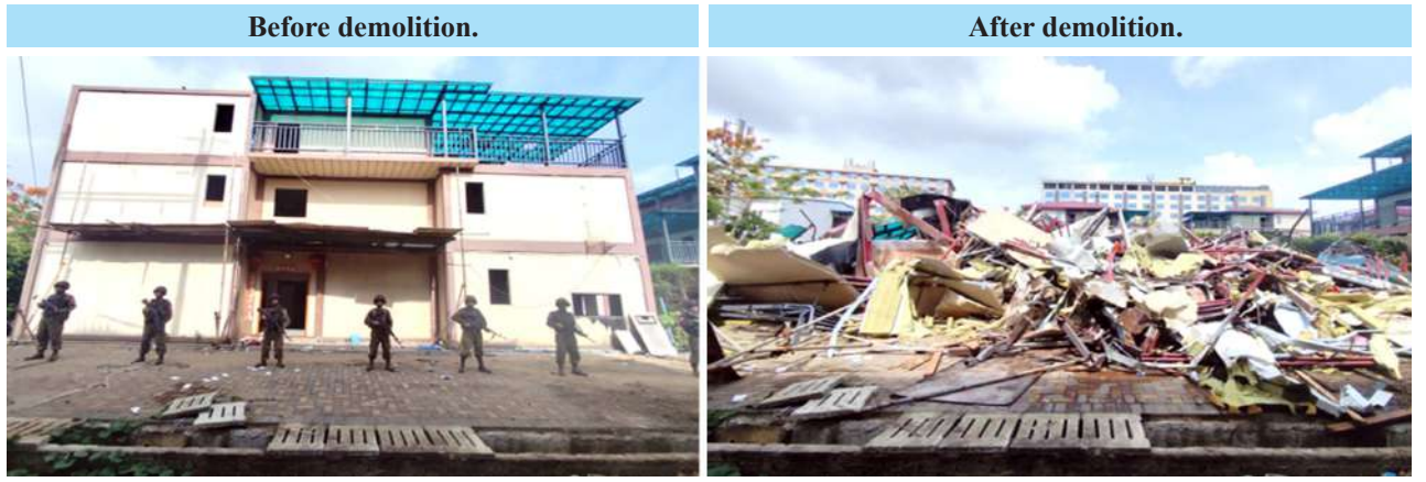
An illegal building used for operating online gambling that was destroyed with heavy machinery in the Shwe Kokko area, Myawaddy District, Kayin State.