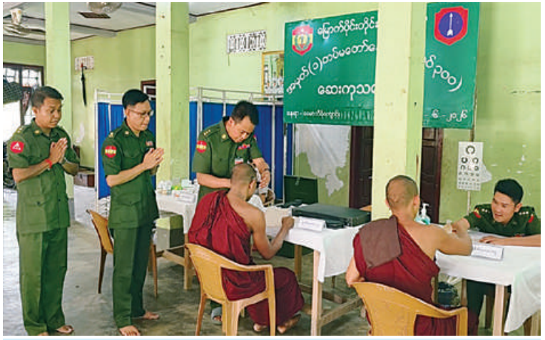
သံဃာတော်များအား ကျန်းမာရေးစောင့်ရှောက်မှုလုပ်ငန်းများ ဆောင်ရွက်ပေး နေမှုကို မြစ်ကြီးနားတပ်နယ်မှ တာဝန်ရှိသူများက ကြည့်ရှုအားပေးစဉ်။

ရိုက်၍ ရောဂါရှာဖွေပေးခြင်းများ ဆောင်ရွက်ပေးပြီး ဆေးရုံတက်ရောက် ကုသရန်လိုအပ်သော သံဃာတော်များ ကို မြစ်ကြီးနားမြို့ရှိ တပ်မတော်ဆေးရုံသို့ တက်ရောက်ကုသနိုင်ရေး စီစဉ်ဆောင် ရွက်ပေးသည်။ ယင်းသို့ ဆောင်ရွက်ပေးနေမှုများကို မြစ်ကြီးနားတပ်နယ်မှ တာဝန်ရှိသူများက သွားရောက်ကြည့်ရှုအားပေးပြီး အဆိုပါ ကျောင်းတိုက်ရှိ သံဃာတော်များကို လှူဖွယ်ပစ္စည်းများနှင့် နေ့ဆွမ်းများ ဆက်ကပ်လှူဒါန်းခဲ့ကြောင်း သတင်း ရရှိသည်။ (၅၀၀)