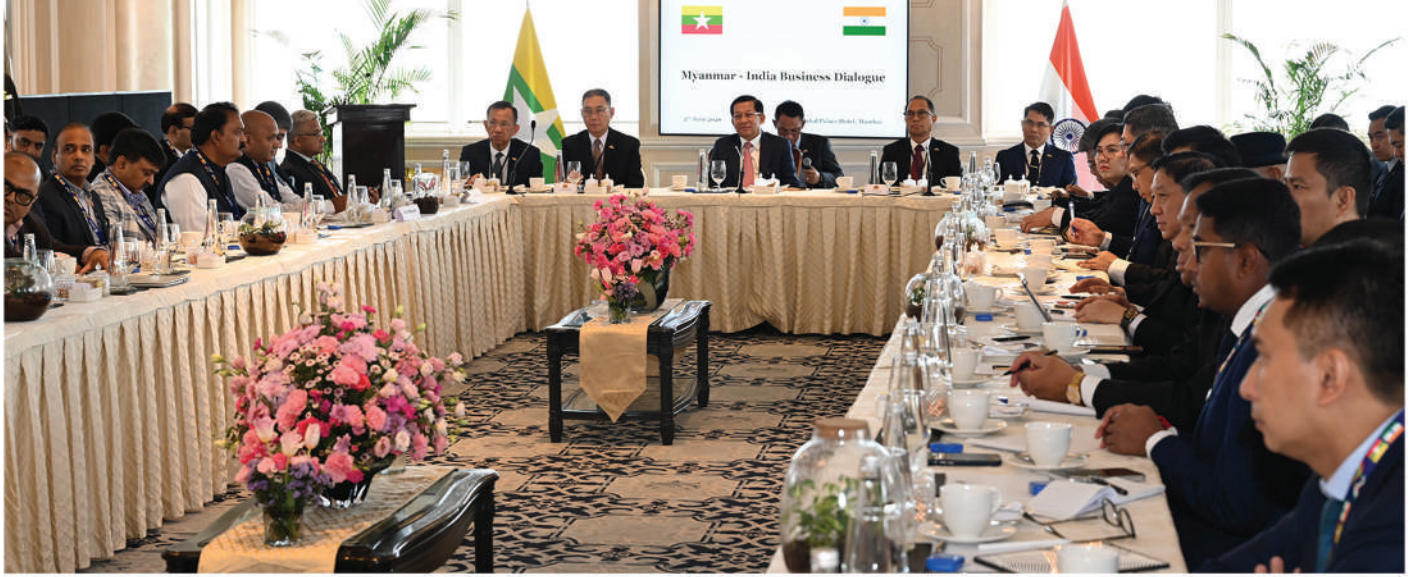
နိုင်ငံတော်သမ္မတ ဦးမင်းအောင်လှိုင် မြန်မာ-အိန္ဒိယ စီးပွားရေးဆွေးနွေးပွဲ (Myanmar-India Business Dialogue) သို့ ဇွန်လ ၃ ရက်နေ့က တက်ရောက်စဉ်။

ညပိုင်းမှာတော့ နိုင်ငံတော်သမ္မတကြီးဦးဆောင်တဲ့ မြန်မာအဆင့်မြင့် ကိုယ်စားလှယ်အဖွဲ့ဟာ Maharashtra Lok Bhavan Mumbai (Governor's House) မှာ မဟာရာရှ်ထရာပြည်နယ်အုပ်ချုပ်ရေးမှူး က တည်ခင်းညှိနှိုင်းတဲ့ ဂုဏ်ပြုညစာစားပွဲကို တက်ရောက်ခဲ့ကြပါတယ်။ ညစာစားပွဲ မကျင်းပမီ မှာ နိုင်ငံတော်သမ္မတနဲ့ ပြည်နယ်အုပ်ချုပ်ရေးမှူးတို့ ဟာ သီးခြားတွေ့ဆုံပြီး နှစ်နိုင်ငံအကြား ချစ်ကြည် ရင်းနှီးမှုနဲ့ စာမျက်နှာ ၂၅ သို့