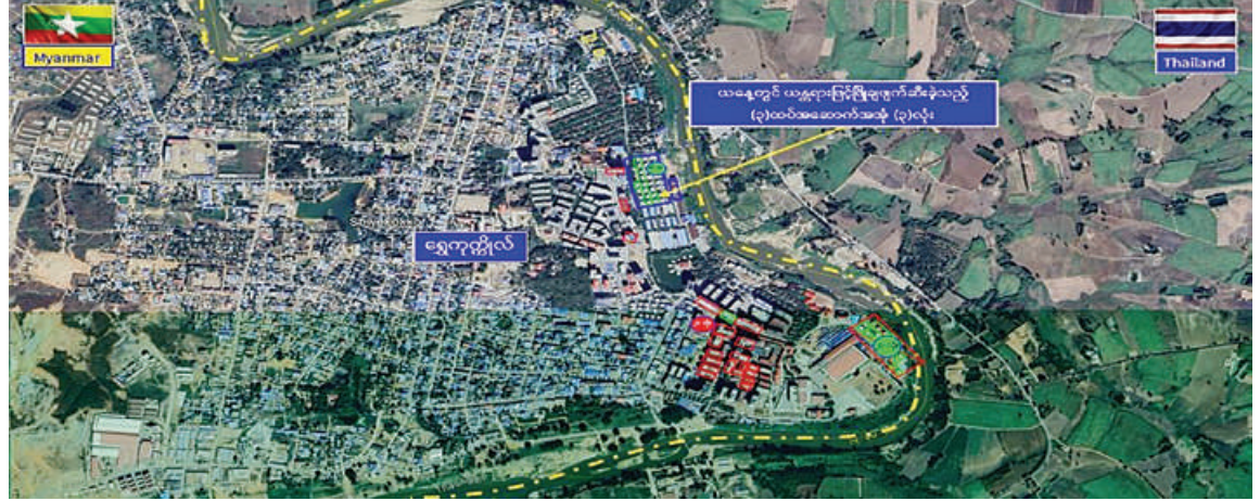
ကရင်ပြည်နယ် မြောက်ပိုင်း ရွှေကုက္ကိုလ်နယ်မြေရှိ အွန်လိုင်းလောင်းကစားလုပ်ငန်းလုပ်ကိုင်ခဲ့သည့် တရားမဝင် အဆောက်အအုံများ ဖြိုချဖျက်ဆီးမှုပြမြေပုံ။

အဆောက်အအုံ ၅၇ လုံးနှင့် ဖောက်ခွဲ ဖျက်ဆီးမည့် အဆောက်အအုံ ၂၀ လုံးဟူ၍ အဆောက်အအုံ အမျိုးအစားအလိုက် ခွဲခြားသတ်မှတ်ပြီး စနစ်တကျ ဖြိုချ ဖျက်ဆီးလျက်ရှိကြောင်း သိရသည်။ ယနေ့တွင် ယာဉ်ယန္တရားဖြင့်ဖြိုချ ဖျက်ဆီးရန် သတ်မှတ်ထားသည့် အဆောက်အအုံ ၅၇ လုံးအနက် သုံးထပ် လူနေအဆောက်အအုံ သုံးလုံးကို ယာဉ် ယန္တရားများအသုံးပြု၍ စနစ်တကျ ထပ်မံဖြိုချဖျက်ဆီးခဲ့ရာ ယနေ့ထိ စုစုပေါင်း အဆောက်အအုံ ၃၃ လုံးကို စနစ်တကျ ဖြိုချဖျက်ဆီးပြီးဖြစ်ကြောင်း နှင့် ဖျက်ဆီးရန်ကျန်ရှိသည့် တရားမဝင် အဆောက်အအုံ ၄၄ လုံးကိုလည်း ဆက်လက်၍ စနစ်တကျဖျက်ဆီးသွား မည်ဖြစ်ကြောင်း သိရသည်။ နိုင်ငံတော်အစိုးရအနေဖြင့် အွန်လိုင်း လိမ်လည်လောင်းကစားမှု တိုက်ဖျက်ရေး လုပ်ငန်းစဉ်များကို အမျိုးသားရေး တာဝန်တစ်ရပ်အဖြစ်ခံယူ၍ မြန်မာနိုင်ငံ အတွင်း လုံးဝအခြေမပြုနိုင်ရေးအတွက် ပြည်တွင်းအင်အားစုများအပြင် အိမ်နီးချင်း နိုင်ငံများနှင့်လည်း ပေါင်းစပ်ညှိနှိုင်း၍ တက်ကြွစွာ ဆောင်ရွက်လျက်ရှိကြောင်း သတင်းရရှိသည်။ (၅၀၀)