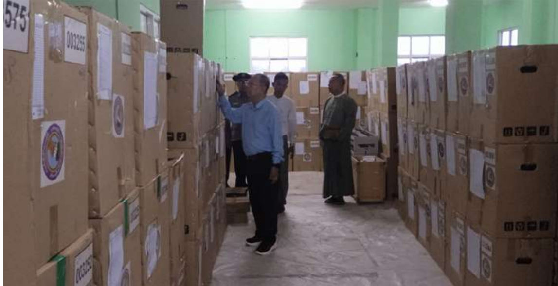
နေပြည်တော် ဇွန် ၄ ပြည်ထောင်စုရွေးကောက်ပွဲကော်မရှင် ဥက္ကဋ္ဌ ဦးသန်းစိုးသည် မြိတ်ခရိုင်အတွင်းရှိ အဖွဲ့ဝင် ဦးအောင်လွင်ဦး၊ ဦးသန်းထွတ်သိန်းတို့နှင့် အတူ ယနေ့တွင် တနင်္သာရီတိုင်းဒေသကြီး

ထားဝယ်ခရိုင်၊ မြိတ်ခရိုင်အတွင်းရှိ ၂၀၂၅ ခုနှစ် အထွေထွေရွေးကောက်ပွဲ အသုံးပြုခဲ့သော မြန်မာအီလက်ထရောနစ်မဲပေးစက်(MEVM)များ ထိန်းသိမ်းထားရှိမှုကို ကြည့်ရှုစစ်ဆေးသည်။ ထို့နောက် တိုင်းဒေသကြီးအစိုးရအဖွဲ့ အစည်းအဝေးခန်းမ၌ MEVM မဲပေးစက် ဆိုင်ရာ ကြီးကြပ်မှုကော်မတီဝင်များနှင့် လည်းကောင်း၊ မြိတ်ခရိုင်အထွေထွေ အုပ်ချုပ်ရေးဦးစီးဌာန အစည်းအဝေးခန်းမ၌ မဲပေးစက်ဆိုင်ရာကြီးကြပ်မှုကော်မတီမှ တာဝန်ရှိသူများနှင့်လည်းကောင်း သီးခြားစီ တွေ့ဆုံသည်။ တွေ့ဆုံစဉ်ပြည်ထောင်စုရွေးကောက်ပွဲ ကော်မရှင်ဥက္ကဋ္ဌက ကျင်းပပြီးခဲ့သည့် ရွေးကောက်ပွဲ အတွေ့အကြုံများအပေါ် အားနည်းချက်၊ အားသာချက်များကို သုံးသပ်ပြီး နောင်ကျင်းပမည့် ရွေးကောက်ပွဲများအတွက် ကြိုတင်ပြင်ဆင်ထားရန် လိုကြောင်း၊ ရွေးကောက်ပွဲကျင်းပရာတွင် မဲစာရင်းမှန်ကန်ရေးသည် အလွန်အရေးကြီးသည့်အတွက် သက်ဆိုင်ရာအထွေထွေ အုပ်ချုပ်ရေးဦးစီးဌာန၊ လူဝင်မှုကြီးကြပ်ရေးနှင့် ပြည်သူ့အင်အားဝန်ကြီးဌာနတို့ လစဉ် တိုက်ဆိုင်စစ်ဆေးရန် လိုအပ်ကြောင်းဖြင့် ဆွေးနွေးမှာကြားသည်။ ထို့နောက် MEVM မဲပေးစက်များ ထိန်းသိမ်းထားရှိမှုအခြေအနေကို ကြည့်ရှု စစ်ဆေးပြီး မဲပေးစက်များသည် ကြီးကြပ် ကန့်သတ်ပစ္စည်းများဖြစ်၍ ထိခိုက်ပျက်စီး မှုမရှိစေရေး အီလက်ထရောနစ်မဲပေးစက် စစ်ဆေးထိန်းသိမ်းခြင်းဆိုင်ရာ လုပ်ငန်း လမ်းညွှန်ချက်အတိုင်း အလေးထား ဆောင်ရွက်ရန်မှာကြားခဲ့ကြောင်း သတင်း ရရှိသည်။ (သတင်းစဉ်)