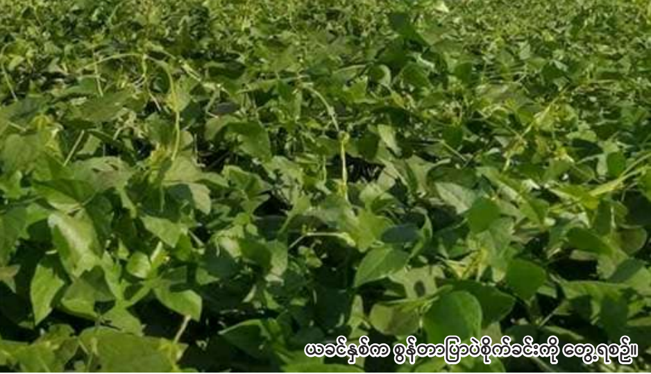
ဖခင်နှစ်က စွန်တာပြာပဲစိုက်ခင်းတို့ တွေ့ရစဉ်။

ရွှေဘို ဇွန် ၄ စစ်ကိုင်းတိုင်းဒေသကြီး ရွှေဘို ခရိုင်တွင် ယခုနှစ် မိုးသီးနှံစိုက်ပျိုး ရာသီ၌ စွန်တာပြာပဲ ၁၀၀၄၅ ဧက စိုက်ပျိုးမည်ဖြစ်ကြောင်း ရွှေဘို ခရိုင် စိုက်ပျိုးရေးဦးစီးဌာနမှ သိရသည်။ ရွှေဘိုခရိုင်တွင် ယခုနှစ် မိုးသီးနှံစိုက်ပျိုးရာသီ၌ စွန်တာ ပြာပဲ စိုက်ပျိုးရန်အတွက် မြို့နယ် အလိုက် လျာထားမှုအနေဖြင့် ရွှေဘိုမြို့နယ်တွင် ၁၈၃၄ ဧက၊ ဝက်လက်မြို့နယ်တွင် ၅၈၅၄ ဧက၊ ကျောက်မြောင်းမြို့နယ်ခွဲ တွင် ၂၄၅၇ ဧက စုစုပေါင်း ၁၀၀၄၅ ဧကတို့ဖြစ်ပြီး အဆိုပါစိုက်ပျိုးမှုကို ယခုနှစ် ဇွန်လဒုတိယပတ်မှ စတင် စိုက်ပျိုးသွားမည်ဖြစ် ကြောင်း သိရသည်။ "ဒီနှစ် မိုးသီးနှံစိုက်ပျိုးရာသီ ရွှေဘိုခရိုင်မှာ စွန်တာပြာပဲ ၁၀၀၄၅ ဧက ကျော် စိုက်ပျိုးဖို့အတွက် လျာထားပါတယ်။ လျာထားဧက ပြည့်မီအောင်စိုက်ပျိုးနိုင်ဖို့အတွက် ဆောင်ရွက်ပေးမယ်။ စွန်တာပြာပဲ စိုက်ပျိုးမှုနဲ့ပတ်သက်ပြီး တိုးချဲ့ စိုက်ပျိုးဖို့ အထွက်နှုန်းကောင်းမွန် ဖို့ မျိုးကောင်းမျိုးသန့်တွေသုံးစွဲဖို့ ပညာပေးတာတွေရှိပါတယ်" ဟု ရွှေဘိုခရိုင် စိုက်ပျိုးရေးဦးစီးဌာန