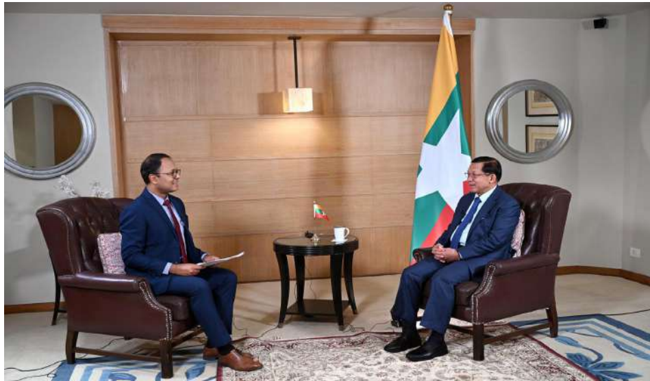
President U Min Aung Hlaing answering the questions of the Doordarshan (DD India News) during a news interview.

A: We discussed a wide range of issues at the meeting. The promotion of economic cooperation and trade between the two countries was included in the objectives of my visit. We discussed the said topics. Additionally, we identified the possible areas where India could