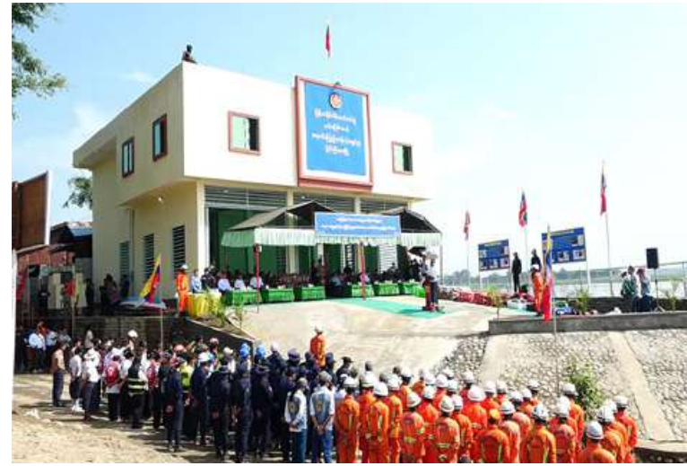
ရေဘေးအန္တရာယ်နှင့် ရေပြင်ရှာဖွေကယ်ဆယ်ရေးဇာတ်တိုက်လေ့ကျင့်မှု ပြုလုပ်စဉ်။

နေပြည်တော် ဇွန် ၄ ရေဘေးအန္တရာယ်နှင့် ရေပြင်ရှာဖွေ ကယ်ဆယ်ရေး ဇာတ်တိုက်လေ့ကျင့်မှုကို ယနေ့နံနက်ပိုင်းတွင် ကချင်ပြည်နယ် မြစ်ကြီးနားမြို့ ကချင်စုရပ်ကွက်ရှိ မြန်မာ နိုင်ငံ မီးသတ်တပ်ဖွဲ့ နယ်မြေမီးသတ် ရေကင်းကြည့်ခန်း၌ ပြုလုပ်ရာ ကချင် ပြည်နယ်ဝန်ကြီးချုပ် ဦးခက်ထိန်နန်း၊ မြောက်ပိုင်းတိုင်းစစ်ဌာနချုပ် တိုင်းမှူး ဗိုလ်ချုပ်အောင်ဇော်ထွေးနှင့် တာဝန်ရှိသူ များ၊ ပြည်နယ်ဝန်ကြီးများ၊ ပြည်နယ်၊ ခရိုင်၊ မြို့နယ်အဆင့် ဌာနဆိုင်ရာ တာဝန်ရှိသူများ၊ ဖိတ်ကြားထားသည့် ဧည့်သည်တော်များနှင့် ရေပြင်ရှာဖွေ ကယ်ဆယ်ရေးတပ်ဖွဲ့ဝင်များ တက်ရောက် ကြည့်ရှုကြသည်။ ဦးစွာ ပြည်နယ်ဝန်ကြီးချုပ်က အမှာ စကားပြောကြားသည်။ ထို့နောက် ပြည်နယ် ဝန်ကြီးချုပ်၊ တိုင်းမှူးနှင့် တာဝန်ရှိသူများ က ခင်းကျင်းပြသထားသော ရေပြင်ရှာဖွေ ကယ်ဆယ်ရေး ပစ္စည်းကိရိယာများကို လှည့်လည်ကြည့်ရှုကြသည်။ ဆက်လက်၍ ပြည်နယ်ဝန်ကြီးချုပ်၊ တိုင်းမှူးနှင့် တက်ရောက်လာကြသူများ သည် ရေပြင်ရှာဖွေကယ်ဆယ်ရေးတပ်ဖွဲ့ဝင် များ၏ ရှာဖွေကယ်ဆယ်ရေး စက်လှေဖြင့် ကယ်ဆယ်ရေးသရုပ်ပြသခြင်း၊ LifeBouy အသုံးပြု၍ ကယ်ဆယ်ရေးသရုပ်ပြသခြင်း နှင့် ရှာဖွေကယ်ဆယ်ရေးစက်လှေများဖြင့် ချိတ်တက်သရုပ်ပြသခြင်းတို့နှင့် ဇာတ်တိုက် သရုပ်ပြလေ့ကျင့်နေမှုများကို ကြည့်ရှု အားပေးကြသည်။ ယင်းနောက် ပြည်နယ်ဝန်ကြီးချုပ်၊ တိုင်းမှူးနှင့် တာဝန်ရှိသူများက ရှာဖွေ ကယ်ဆယ်ရေးတပ်ဖွဲ့ဝင်များကို အသက် ကယ်အင်္ကျီ(Life Jacket)များနှင့် ဂုဏ်ပြု ချီးမြှင့်ငွေများကို ပေးအပ်ချီးမြှင့်ခဲ့ကြောင်း သတင်းရရှိသည်။ (၅၀၁)