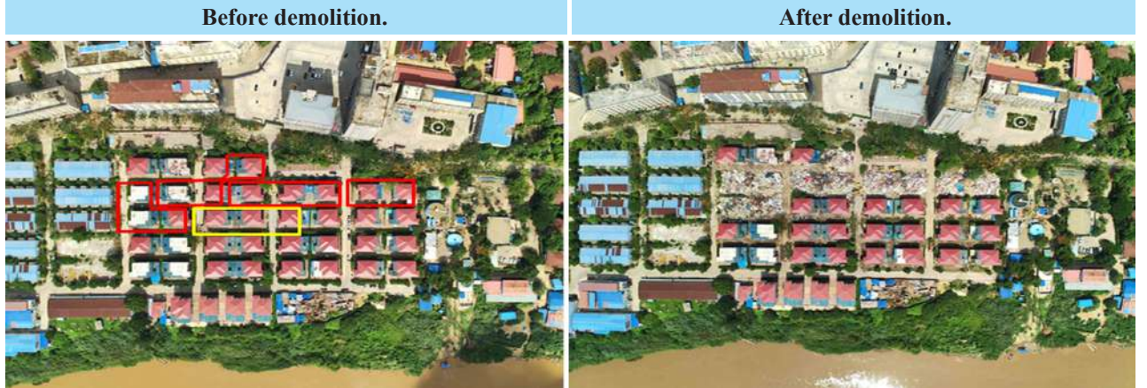
An illegal building used for operating online gambling that was destroyed with heavy machinery in the Shwe Kokko area, Myawaddy District, Kayin State.