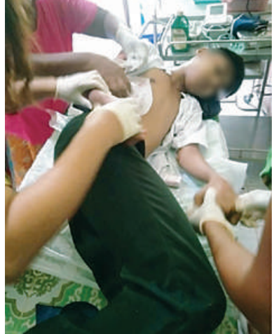
ဗုံးသီးစထိမှန်၍ ဒဏ်ရာရရှိသည့် ကျောင်းသား ဆေးကုသမှုခံယူနေမှုကို တွေ့ရစဉ်။

ခွန်စိုက် ကြိုးပမ်းဆောင်ရွက်ခဲ့ပြီး စာသင် ကျောင်းများကို ၅ ဇွန် ၁ ရက်မှစတင်၍ ဖွင့်လှစ်သင်ကြားပေးလျက်ရှိသည်။ သို့ရာတွင် PDF အမည်ခံအကြမ်းဖက် သမားများသည် အနာဂတ်ရင်သွေးငယ် များ၏ ပညာသင်ကြားသင်ယူခွင့် အခွင့် အလမ်းများပျက်ပြား၍ ပညာမဲ့လူတန်း စားများဖြစ်ပေါ်လာစေရန်နှင့် ၎င်းတို့ကို အကြောက်တရားဖြင့် ထောက်ခံအားပေး လာစေရန် ယုတ်မာရိုင်းစိုင်းသော ရည်ရွယ်ချက်များဖြင့် ကျောင်းသား၊ ဆရာ၊ မိဘများကို ခြိမ်းခြောက်အကျပ် ကိုင်ခြင်း၊ ဖမ်းဆီးသတ်ဖြတ်ခြင်း၊ ပညာရေးဆိုင်ရာ အဆောက်အအုံများကို မီးရှို့ဖျက်ဆီးခြင်း၊ မိုင်းထောင်ဖောက်ခွဲ ခြင်း၊ အထောက်အကူပြုပစ္စည်းများနှင့် ကျောင်းသုံး ပုံနှိပ်စာအုပ်များ၊ ကျောင်းသုံး စာအုပ်များကို မီးရှို့ဖျက်ဆီးခြင်း၊ အတင်း အဓမ္မလှူယူခြင်း စသည့် နည်းလမ်းမျိုးစုံ