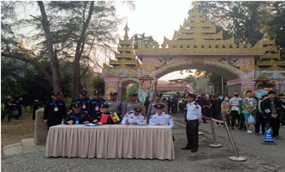
Photo documentation of the deportation and handover of foreign nationals arrested for online scams and online gambling.