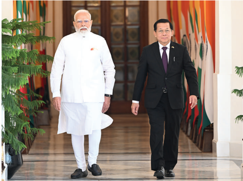
နိုင်ငံတော်သမ္မတ ဦးမင်းအောင်လှိုင်အား အိန္ဒိယသမ္မတနိုင်ငံ ဝန်ကြီးချုပ် ရှင်ဂျာရန်ဒရာမိုဒီက အိန္ဒိယနိုင်ငံဝန်ကြီးချုပ်ရုံး (Hyderabad House)၌ ဇွန်လ ၁ ရက်နေ့က ရင်းရင်းနှီးနှီးခရီးဦးကြိုဆိုစဉ်။

နိုင်ငံတစ်ခုဖွံ့ဖြိုးတိုးတက်ဖို့ဆိုတာ နိုင်ငံရေးအားကောင်းဖို့၊ စီးပွားရေးအားကောင်းဖို့နဲ့ ကာကွယ်ရေးအားကောင်းဖို့လိုအပ်ပါတယ်။ ဒီလို နိုင်ငံအတွက် အဓိကမောင်းနှင်အားတွေကောင်းနေဖို့အတွက်ဆိုရင် မိမိတို့နိုင်ငံတစ်ခုတည်းနဲ့ တည်ဆောက်နေလို့ရပါဘူး။ ဒါကြောင့် အိမ်နီးချင်းနိုင်ငံတွေ၊ ဒေသတွင်းနိုင်ငံတွေ၊ မိတ်ဆွေနိုင်ငံတွေနဲ့ ဘက်စုံမဟာဗျူဟာမြောက် မိတ်ဖက်ဆက်ဆံရေးတွေကို တည်ဆောက်သွားနိုင်ဖို့ လိုအပ်ပါတယ်။ မိမိတို့နိုင်ငံဟာ ယခုအချိန်မှာ ပြည်သူတွေက ရွေးချယ်တင်မြောက်ထားတဲ့ အစိုးရနဲ့ လွှတ်တော်ဟာ နိုင်ငံတော်ကို ဒီမိုကရေစီလမ်းကြောင်းပေါ်မှာ ခိုင်ခိုင်မာမာနဲ့ဆက်လက်လျှောက်လှမ်းနိုင်ရေး ကြိုးပမ်းဆောင်ရွက်လျက်ရှိနေတာကိုလည်း တွေ့မြင်နေရမှာပဲဖြစ်ပါတယ်။