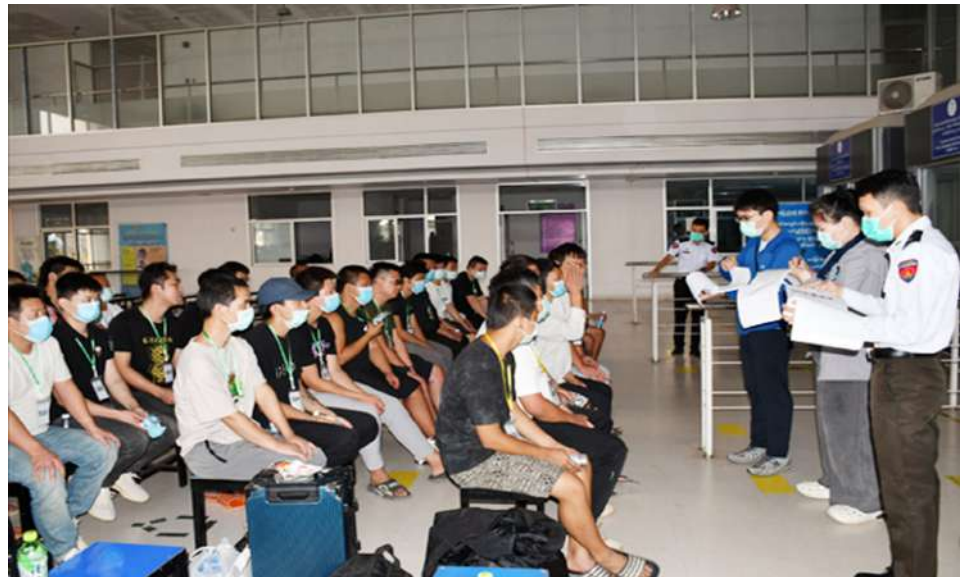
Photo documentation of the deportation and handover of foreign nationals arrested for online scams and online gambling.

Nay Pyi Taw June 2 Online scams and online gambling have been operating primarily in Myanmar-China border areas such as Shan State (Namkham, Muse, Laukkaing, Chinshwehaw, Pansan, Mongla, Tachilek) and Myanmar-Thailand border areas such as Kayin State (Shwe Kokko, Mahtawthalay, Minletpan, and Phayathonezu), where ethnic armed organizations are active. These online scams and online gambling activities constitute national security threats and are classified as crimes against a large number of people, with various countries severely suffering from the resulting consequences and negative impacts. The government is prioritizing efforts to combat online scams and online gambling, which pose a danger to the international community and the entire world, as a national duty. To ensure that these globally harmful online scams and online gambling