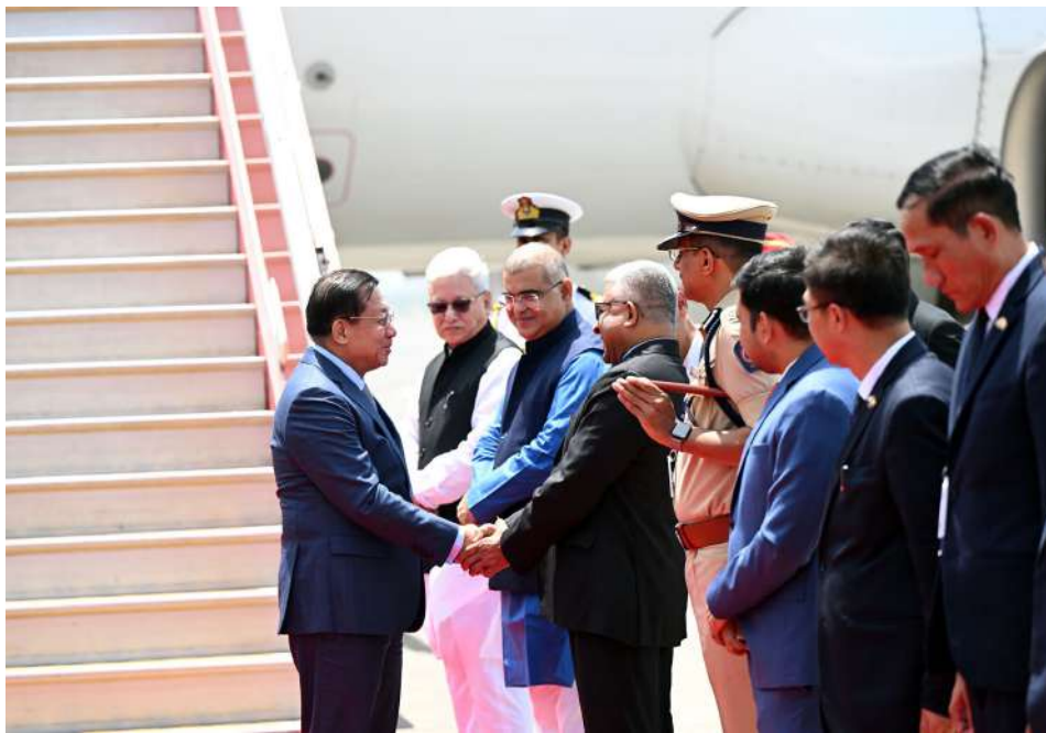
President U Min Aung Hlaing being welcomed at the Chhatrapati Shivaji Maharaj International Airport in Mumbai.