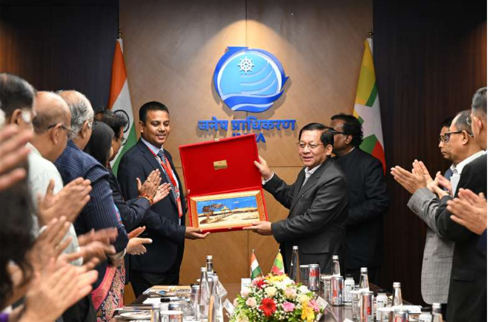
ပြည်ထောင်စုသမ္မတမြန်မာနိုင်ငံတော် နိုင်ငံတော်သမ္မတ ဦးမင်းအောင်လှိုင်နှင့် ဂျပါဟာလာနေရှူးဆိပ်ကမ်း အာဏာပိုင်ဥက္ကဋ္ဌတို့ အမှတ်တရလက်ဆောင်ပစ္စည်းများ အပြန်အလှန်ပေးအပ်စဉ်။

၂၆ ရှေ့မှအဆက် မွမ်ဘိုင်းမြို့ Chhatrapati Shivaji Maharaj အပြည်ပြည်ဆိုင်ရာလေဆိပ်သို့ ရောက်ရှိကြ ရာ မဟာရာရှ်ထရာပြည်နယ် အုပ်ချုပ်ရေးမှူး Shri. Jishnu Dev နှင့် ပြည်နယ်အစိုးရအဖွဲ့မှ တာဝန်ရှိသူများ၊ ကိုယ်ကတ္တားမြို့ မြန်မာ ကောင်စစ်ဝန်ချုပ်နှင့် ဝန်ထမ်းမိသားစုများက ကြိုဆိုနှုတ်ဆက်ကြသည်။ ထို့နောက် နိုင်ငံတော်သမ္မတ ဦးဆောင် သည့် မြန်မာအဆင့်မြင့်ကိုယ်စားလှယ်အဖွဲ့ သည် ဂျပါဟာလာနေရှူးဆိပ်ကမ်းသို့သွား ရောက်ကြည့်ရှုလေ့လာကြရာ ဆိပ်ကမ်း အာဏာပိုင်အဖွဲ့ဥက္ကဋ္ဌ Mr. Gaurav Dayalias နှင့် ဆိပ်ကမ်းမှ တာဝန်ရှိသူများက ကြိုဆို နှုတ်ဆက်ကြသည်။ ယင်းနောက် ဆိပ်ကမ်းအစည်းအဝေး ခန်းမ၌ တာဝန်ရှိသူများက ဆိပ်ကမ်း အာဏာပိုင်အဖွဲ့အနေဖြင့် နိုင်ငံတော်သမ္မတ ဦးမင်းအောင်လှိုင် ဦးဆောင်သည့် မြန်မာ အဆင့်မြင့်ကိုယ်စားလှယ်အဖွဲ့ကို ဆိပ်ကမ်း မှ လိုက်လံလိုက်လှဲကြိုဆိုနှုတ်ဆက်သ အပ်ပါကြောင်း နှုတ်ခွန်းဆက်စကားပြော ကြားပြီး ဆိပ်ကမ်းဆိုင်ရာသမိုင်းကြောင်းနှင့်