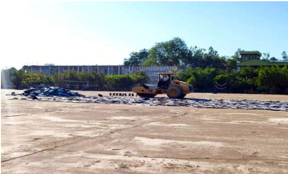
Photo documentation of the destruction of evidence items used in online scams and online gambling activities.