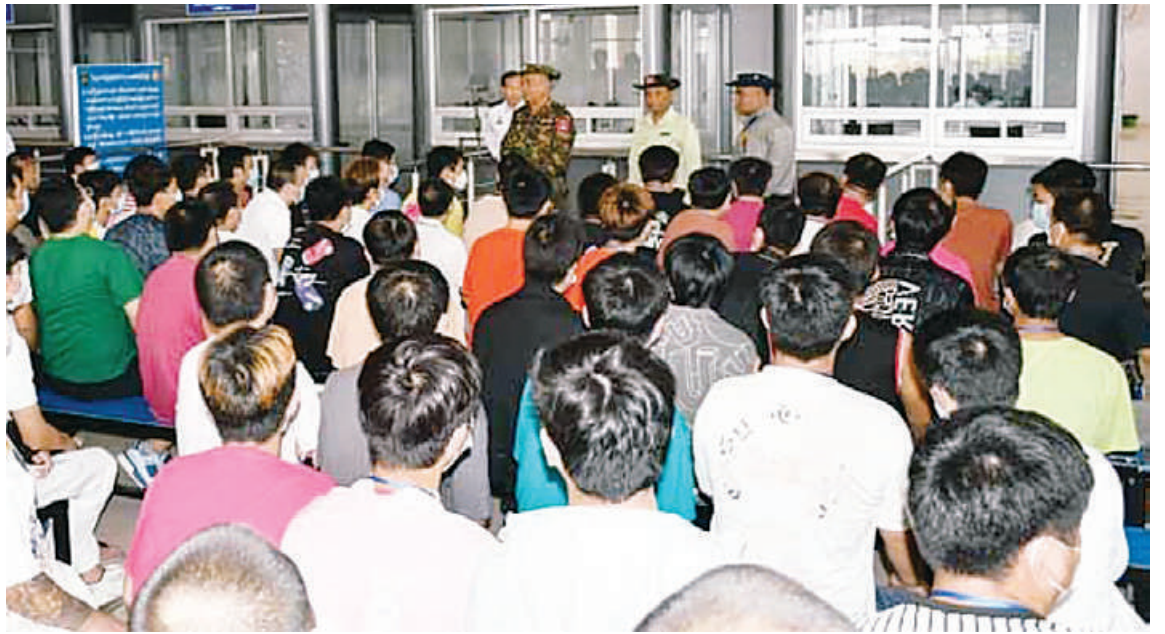
ကရင်ပြည်နယ် မြဝတီခရိုင်၌ အွန်လိုင်းလိမ်လည်မှုနှင့် အွန်လိုင်းလောင်းကစားမှုမှ ဖမ်းဆီးရမိသည့် နိုင်ငံခြားသားများကို ပြည်နှင့်လွှဲပြောင်းပေးအပ်မှုမှတ်တမ်းဓာတ်ပုံ။

အလားတူ ၂၀၂၅ ခုနှစ် နိုဝင်ဘာ ၁၈ ရက်မှစတင်၍ ရွှေကုက္ကိုလ်မြိုင် ကျေးရွာပတ်ဝန်းကျင်ရှိ လုပ်ငန်းဆိုင်ရာ များမှ စစ်ဆေးတွေ့ရှိခဲ့သည့် ကွန်ပျူတာ၊ မော်နီတာ အလုံး ၃၃၀၊ မိုဘိုင်းဖုန်း ဟန်းဆက် အလုံး ၂၀၈၇၀၊ Starlink စက် ၁၀၂ လုံး၊ ကာစီနိုလောင်းကစားခုံ Router ၂၂ လုံးတို့နှင့် မြဝတီမြို့ အမှတ်(၃) ရပ်ကွက်၊ မြဝတီ-မယ်ထော်သလေးသွား ကားလမ်းဘေးရှိ ၆၉ KTV ခြံဝင်းအတွင်းမှ သိမ်းဆည်းရရှိခဲ့သည့် ကွန်ပျူတာ ၈၂