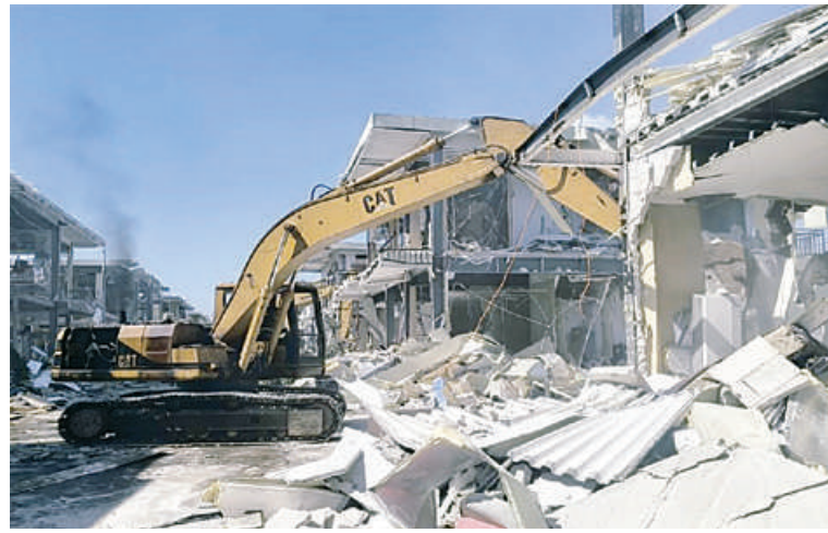
ကရင်ပြည်နယ် မြဝတီခရိုင်၌ အွန်လိုင်းလိမ်လည်မှုနှင့် အွန်လိုင်းလောင်း ကစားမှုတွင် အသုံးပြုသည့် အဆောက်အအုံများကို ဖြိုချဖျက်ဆီးမှုမှတ်တမ်းဓာတ်ပုံ။

ခြင်း၊ စက်ယန္တရားများအသုံးပြု၍ ဖြိုချဖျက်ဆီးခြင်းများ ဆောင်ရွက်ခဲ့ရာ အပိုင်း(၁)တွင် အဆောက်အအုံ ၁၄၇ လုံး ကို ၂၀၂၅ ခုနှစ် အောက်တိုဘာ ၂၃ ရက်မှ နိုဝင်ဘာ ၁၉ ရက်ထိလည်းကောင်း၊ အပိုင်း(၂)တွင် အဆောက်အအုံ ၆၂ လုံးကို ၂၀၂၆ ခုနှစ် ဇန်နဝါရီ ၁ ရက်မှ ၈ ရက်ထိ လည်းကောင်း၊ အပိုင်း(၃)တွင် အဆောက်အအုံ ၄၂၅ လုံးကို ၂၀၂၅ ခုနှစ် နိုဝင်ဘာ ၁၇ ရက်မှ ၂၀၂၆ ခုနှစ် ဇန်နဝါရီ ၆ ရက်ထိလည်းကောင်း ဖျက်ဆီးခဲ့သည်။ ထို့အတူ မြဝတီခရိုင် ရွှေကုက္ကိုလ် ကျေးရွာ၌ အွန်လိုင်းလောင်းကစားလုပ် ကိုင်ရန် တရားမဝင်ဆောက်လုပ်ထား