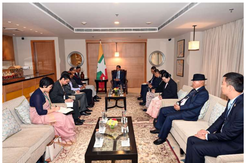
President U Min Aung Hlaing receives Governor of the Reserve Bank of India H.E. Shri. Sanjay Malthotra.