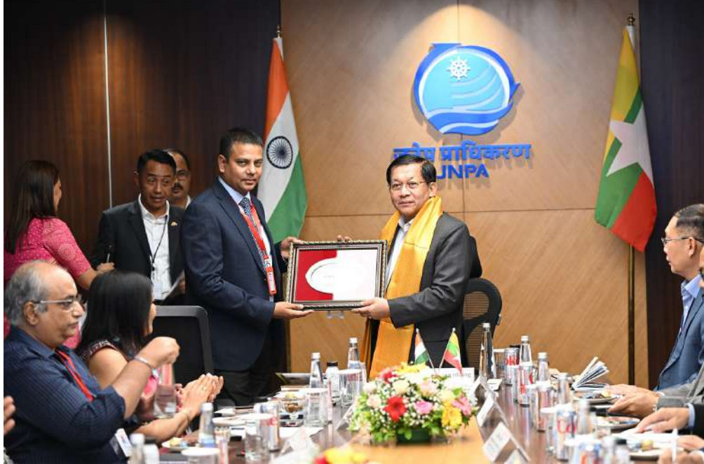
ပြည်ထောင်စုသမ္မတမြန်မာနိုင်ငံတော် နိုင်ငံတော်သမ္မတ ဦးမင်းအောင်လှိုင်နှင့် ဂျပါဟာလာနေရှူးဆိပ်ကမ်း အာဏာပိုင်ဥက္ကဋ္ဌတို့ အမှတ်တရလက်ဆောင်ပစ္စည်းများ အပြန်အလှန်ပေးအပ်စဉ်။