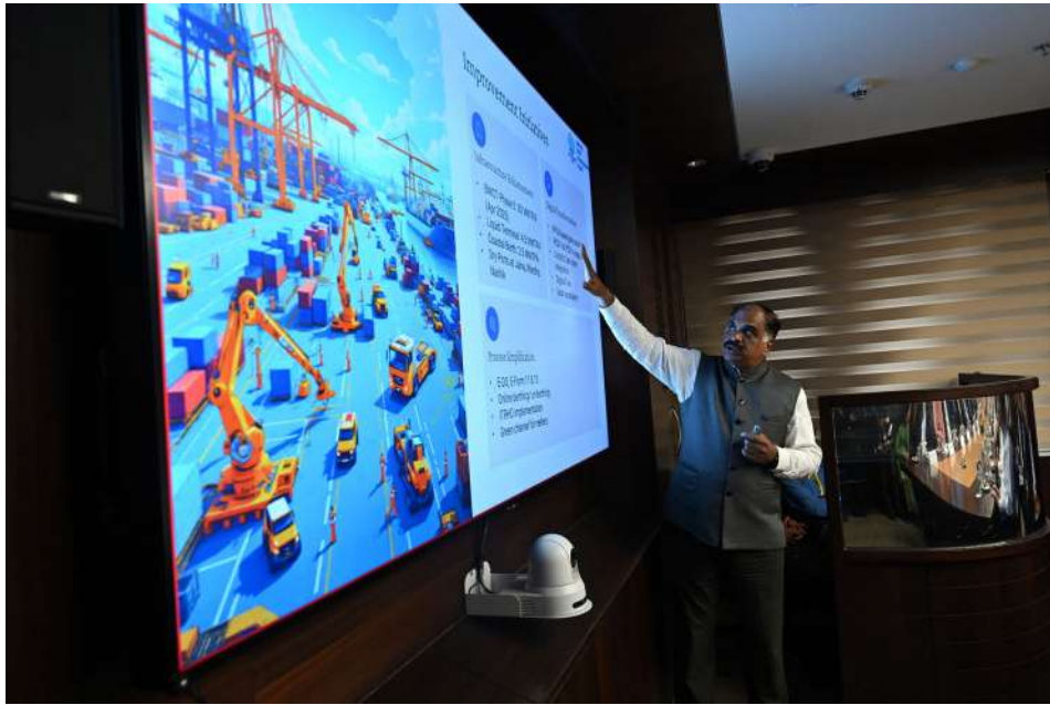
President U Min Aung Hlaing watches a video clip on functions of the Jawaharlal Nehru Port.