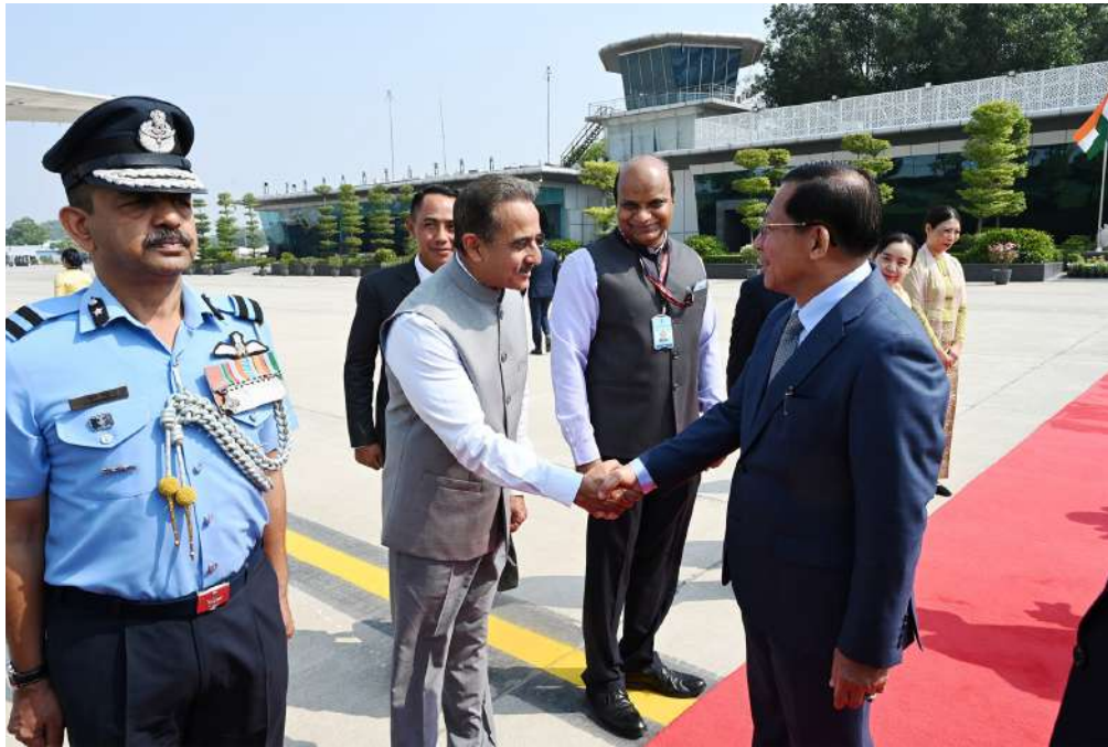
ပြည်ထောင်စုသမ္မတမြန်မာနိုင်ငံတော် နိုင်ငံတော်သမ္မတ ဦးမင်းအောင်လှိုင်အား အိန္ဒိယအစိုးရအဖွဲ့ဝင်ဖြစ်သူ Minister of State for External Affairs Shri Kirti Vardhan Singh နှင့် အိန္ဒိယအစိုးရအဖွဲ့မှ တာဝန်ရှိသူများ၊ သံရုံး၊ စစ်သံရုံးမိသားစုများက နယူးဒေလီမြို့၊ Palam လေတပ်စခန်းတွင် ပို့ဆောင်နှုတ်ဆက်ကြစဉ်။