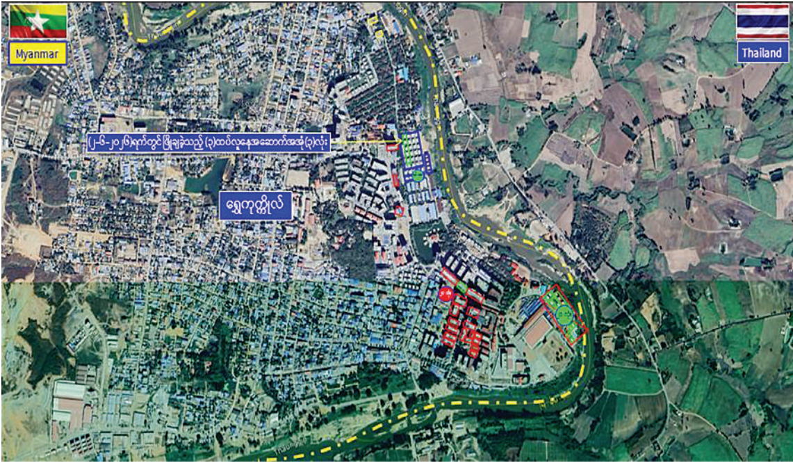
ကရင်ပြည်နယ် မြဝတီခရိုင် ရွှေကုက္ကိုလ်နယ်မြေရှိ အွန်လိုင်းလိမ်လည်လောင်းကစားမှုလုပ်ငန်းများလုပ်ကိုင်ခဲ့သည့် တရားမဝင်အဆောက်အအုံများကို ဖောက်ခွဲဖျက်ဆီးမှုပြုမြေပုံ။

နေပြည်တော် ၉ ဇူလိုင် ၂၀၂၆ - အွန်လိုင်းလိမ်လည်လောင်းကစားမှုများကို အခြေချလုပ်ကိုင်ခဲ့ကြသည့် ကရင်ပြည်နယ် မြဝတီခရိုင် ရွှေကုက္ကိုလ်နယ်မြေနှင့် KK Park နယ်မြေများရှိ တရားမဝင် အဆောက်အအုံများအတွင်း အွန်လိုင်းလိမ်လည်လောင်းကစားမှုများ ထပ်မံကျူးလွန်ခြင်း မပြုနိုင်စေရေးအတွက် အပြီးတိုင်ဖြိုချဖျက်ဆီးခြင်းများနှင့် လုပ်ငန်းလုပ်ဆောင်ရာတွင် အသုံးပြုခဲ့သည့်ပစ္စည်းများအား စနစ်တကျဖျက်ဆီးခြင်းများကို ဌာနဆိုင်ရာပူးပေါင်းအဖွဲ့များဖြင့် ဆောင်ရွက်လျက်ရှိရာ ယနေ့တွင် ရွှေကုက္ကိုလ်နယ်မြေအတွင်းရှိ တရားမဝင် သုံးထပ်လူနေအဆောက်အအုံ သုံးလုံးကို ထပ်မံ၍ စနစ်တကျ ဖြိုချဖျက်ဆီးခဲ့ကြောင်း သိရသည်။ ရွှေကုက္ကိုလ်နယ်မြေ အတွင်း၌ အွန်လိုင်းလိမ်လည် လောင်းကစား