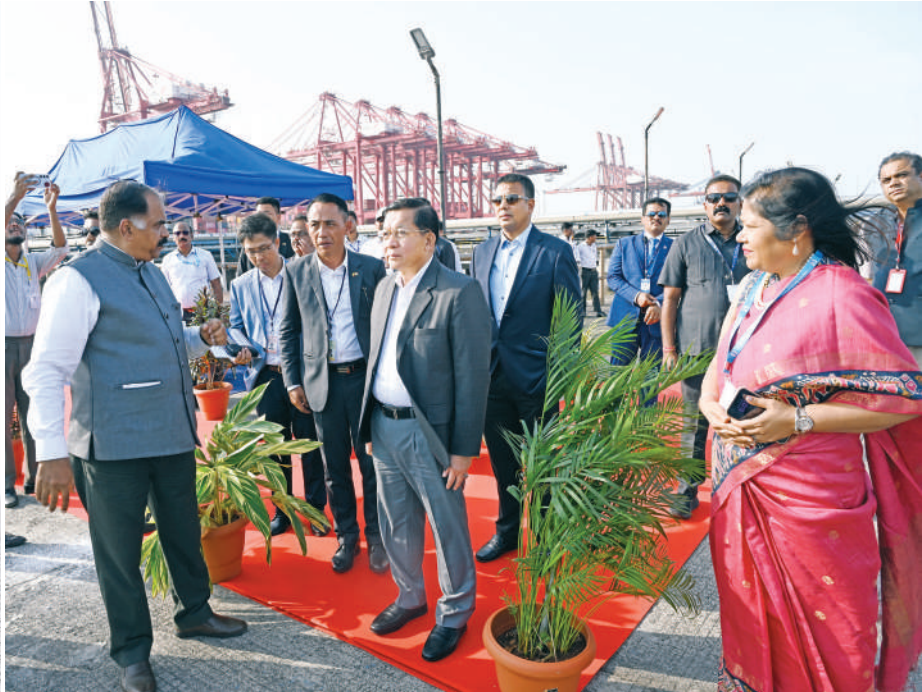
ပြည်ထောင်စုသမ္မတမြန်မာနိုင်ငံတော် နိုင်ငံတော်သမ္မတ ဦးမင်းအောင်လှိုင် ဂျဝါဟာလာနေရူးဆိပ်ကမ်းကို ကြည့်ရှုလေ့လာစဉ်။

နေပြည်တော် ဇွန် ၂ နိုင်ငံတော်သမ္မတ ဦးမင်းအောင်လှိုင် မွမ်ဘိုင်းမြို့သို့ အထူးလေယာဉ်ဖြင့် အဖွဲ့ဝင်ဖြစ်သူ Minister of State for လေဆိပ်တွင် ပို့ဆောင်နှုတ်ဆက်ကြသည်။ အိန္ဒိယနိုင်ငံ နယူးဒေလီမြို့တွင် ဦးဆောင်သည့် မြန်မာအဆင့်မြင့်ကိုယ်စား ဆက်လက်ထွက်ခွာကြသည်။ External Affairs Shri Kirti Vardhan ထို့နောက် နိုင်ငံတော်သမ္မတ ဦးဆောင် တရားဝင်ခရီးစဉ် ရောက်ရှိနေသည့် လှယ်အဖွဲ့သည် ယနေ့နံနက်ပိုင်းတွင် နိုင်ငံတော်သမ္မတ ဦးဆောင်သည့် Singh နှင့် အိန္ဒိယအစိုးရအဖွဲ့မှ တာဝန်ရှိ သည့် ကိုယ်စားလှယ်အဖွဲ့သည် နေ့လယ် ပြည်ထောင်စုသမ္မတ မြန်မာနိုင်ငံတော် နယူးဒေလီမြို့ Palam လေတပ်စခန်းမှ ကိုယ်စားလှယ်အဖွဲ့ကို အိန္ဒိယအစိုးရ သူများ၊ သံရုံး၊ စစ်သံရုံးမိသားစုများက ပိုင်းတွင် စာမျက်နှာ ၁၆ ကော်လံ ၁၂