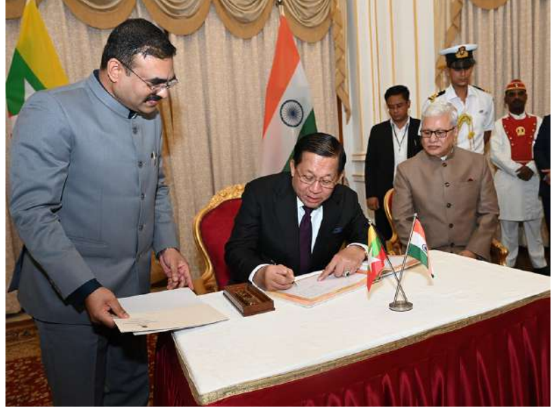
ပြည်ထောင်စုသမ္မတမြန်မာနိုင်ငံတော် နိုင်ငံတော်သမ္မတ ဦးမင်းအောင်လှိုင် Maharashtra Lok Bhavan Mumbai (Governor's House) ဧည့်သည်တော်မှတ်တမ်းစာအုပ်တွင် မှတ်တမ်းတင်လက်မှတ်ရေးထိုးစဉ်။

နေပြည်တော် ၇ ဇူလိုင် အိန္ဒိယနိုင်ငံ မွမ်ဘိုင်းမြို့၌ တရားဝင်ခရီးစဉ်ရောက်ရှိနေသည့် ပြည်ထောင်စုသမ္မတမြန်မာနိုင်ငံတော် နိုင်ငံတော်သမ္မတ ဦးမင်းအောင်လှိုင်သည် ယနေ့ညနေပိုင်းတွင် မဟာရာရှ်ထရာပြည်နယ် အုပ်ချုပ်ရေးမှူး Shri. Jishnu Dev Verma နှင့် တွေ့ဆုံဆွေးနွေးသည်။