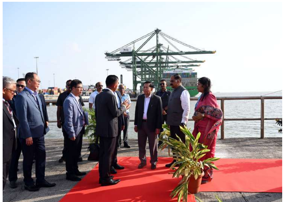
President U Min Aung Hlaing visits the Jawaharlal Nehru Port.

Nay Pyi Taw June 2 President of the Republic of the Union of Myanmar U Min Aung Hlaing and high-level Myanmar delegation, who were on an official visit to New Delhi, India, left Palam Air Force Station in New Delhi for Mumbai by a special flight this morning. The President and delegation were seen off at the airport by Minister of State for External Affairs Shri Kirti Vardhan Singh, a member of the Indian government, and officials of the Indian government and families of the embassy and military attaché office. On arrival at the Chhatrapati Shivaji Maharaj International Airport in Mumbai in the afternoon,