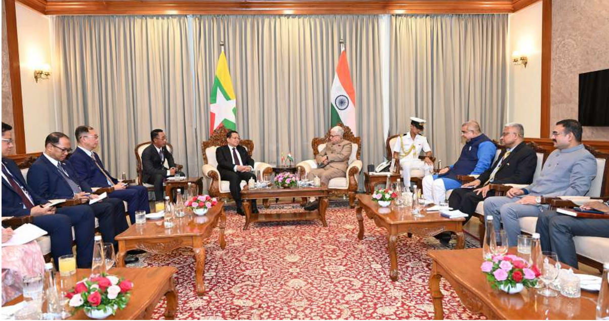
ပြည်ထောင်စုသမ္မတမြန်မာနိုင်ငံတော် နိုင်ငံတော်သမ္မတ ဦးမင်းအောင်လှိုင်နှင့် မဟာရာရှ်ထရာပြည်နယ်အုပ်ချုပ်ရေးမှူး Shri. Jishnu Dev Verma တို့ တွေ့ဆုံဆွေးနွေးစဉ်။