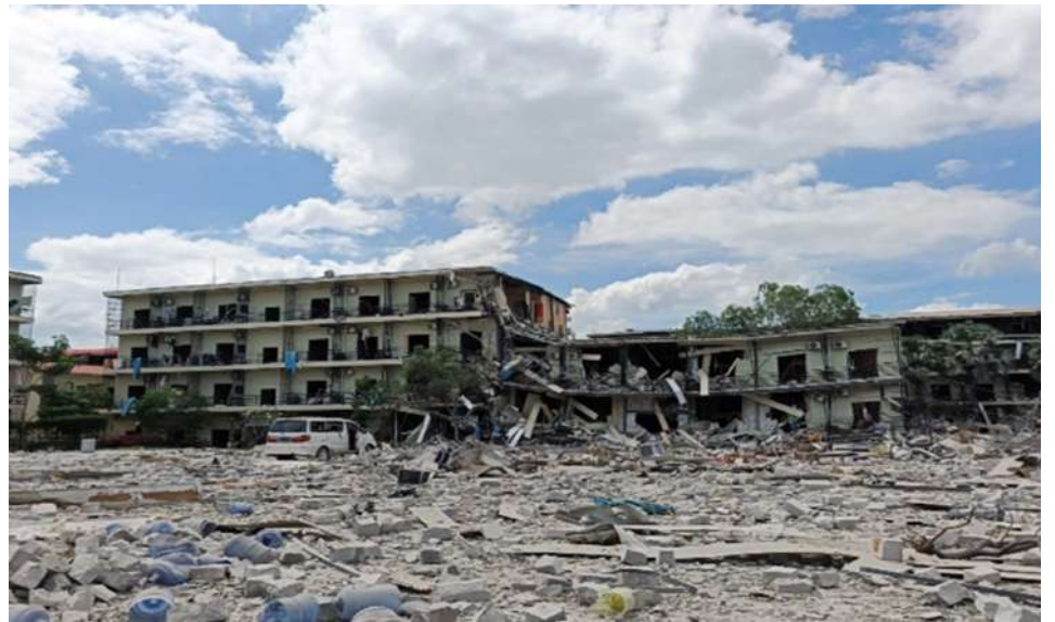
Photo documentation of the burning and destruction of buildings used for online scams and online gambling.