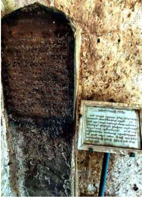
အလောင်းစည်သူရေးထိုးသည့် ရွှေဂူကြီးဘုရားကျောက်စာကို တွေ့ရစဉ်။

ပုဂံခေတ်တွင် ရေးထိုးခဲ့သည့် ကျောက်စာ အများစုသည် မြန်မာဘာသာဖြင့် ရေးထိုးသည့် ကျောက်စာများဖြစ်ကြသည်။ သို့သော် ပုဂံ ကျောက်စာများတွင် မွန်ဘာသာ၊ ပါဠိဘာသာ စသည့်အခြားဘာသာစကားများဖြင့် ရေးထိုးထားသည့် ကျောက်စာများကိုလည်းတွေ့ရှိရသည်။