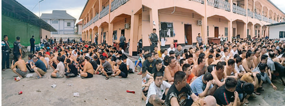
(၂၈-၆-၂၀၂၄)ရက်နေ့တွင် ရှမ်းပြည်နယ် တာချီလိတ်မြို့နယ်တို့တွင် တရားမဝင် Online လောင်းကစားလုပ်ကိုင်သူ မြန်မာနိုင်ငံသား ၁၂ ဦး၊ တရုတ်နိုင်ငံသား ၂၉၅ ဦးတို့ကို သက်သေခံပစ္စည်းများနှင့်အတူ ဖမ်းဆီးရမိမှုမှတ်တမ်းဓာတ်ပုံ။

ထို့အတူ အွန်လိုင်းလိမ်လည်မှုနှင့် အွန်လိုင်းလောင်းကစားမှုများ ပပျောက်စေရေးအတွက် တပ်မတော်စစ်ကြောင်းများနှင့် လုံခြုံရေးတပ်ဖွဲ့ဝင်များပါဝင်သော ပူးပေါင်းအဖွဲ့များဖြင့် နယ်မြေလုံခြုံရေးလုပ်ငန်းများဆောင်ရွက်ခဲ့ရာ ရှမ်းပြည်နယ်နှင့် ကရင်ပြည်နယ်အတွင်း အွန်လိုင်း လောင်းကစားပြုလုပ်သည့် အဆောက်အအုံများကို အများဆုံးတွေ့ရှိ