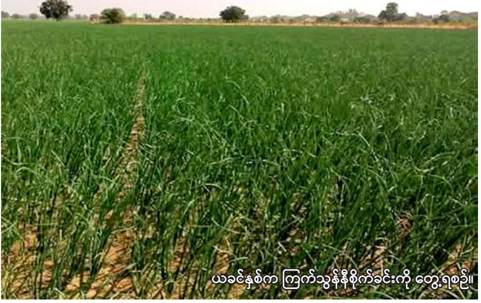
ယခင်နှစ်က ကြက်သွန်နီစိုက်ခင်းကို တွေ့ရစဉ်။

မုံရွာ ဇွန် ၂ စစ်ကိုင်းတိုင်းဒေသကြီး နာဂကိုယ်ပိုင်အုပ်ချုပ်ခွင့်ရ ဒေသတွင် ယခုနှစ် မိုးသီးနှံစိုက်ပျိုးရာသီ၌ စားဖိုဆောင်သီးနှံ ၁၅၅၆ ဧက စိုက်ပျိုးသွားမည် ဖြစ်ကြောင်း စစ်ကိုင်းတိုင်းဒေသကြီး စိုက်ပျိုးရေးဦးစီးဌာနမှ သိရသည်။ မိုးသီးနှံစိုက်ပျိုးရာသီ၌ နာဂကိုယ်ပိုင်အုပ်ချုပ်ခွင့်ရ ဒေသတွင် စားဖိုဆောင်သီးနှံ ၁၅၅၆ ဧက စိုက်ပျိုးရန်လျာထားပြီး ယခုနှစ် ဇွန်လဒုတိယပတ်မှ စတင်စိုက်ပျိုးသွားမည် ဖြစ်ကြောင်း သိရသည်။ "ဒီနှစ် မိုးသီးနှံစိုက်ပျိုးရာသီ နာဂကိုယ်ပိုင်အုပ်ချုပ်ခွင့်ရ ဒေသမှာ စားဖိုဆောင်သီးနှံ ၁၅၅၆ ဧက၊ အာလူး ၉၅ ဧက၊ ဆွမ္မရာမြို့တွင် ၄၅၀ ဧက၊ အာလူး ၉၅ ဧက၊ လဟယ်