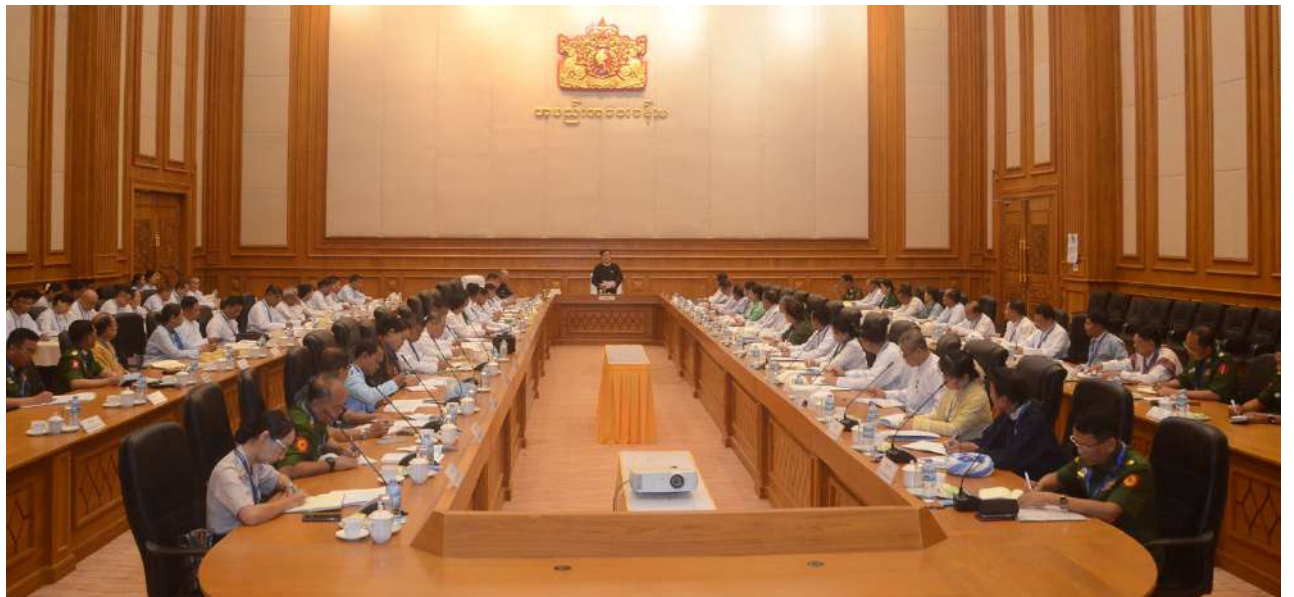
Speaker of the Union Parliament and Amyotha Hluttaw U Aung Lin Dwe meets with members of the Amyotha Hluttaw Standing Committees.

pivotal role in legislation, financial oversight, and ensuring that parliamentary representatives adhere to ethical standards in the discharge of their duties. The Speaker said that the activities of the committees, together with Parliament's efforts to implement the aspirations of the people, demonstrate Parliament's commitment to serving the public while also promoting government transparency and accountability. He encouraged the committees to