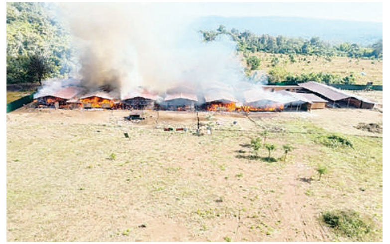
ရှမ်းပြည်နယ် ကျောက်မဲမြို့နယ်၌ အွန်လိုင်းလိမ်လည်မှုနှင့် အွန်လိုင်းလောင်း ကစားမှုတွင် အသုံးပြုသည့် အဆောက်အအုံများကို မီးရှို့ဖျက်ဆီးမှုမှတ်တမ်းဓာတ်ပုံ။

နိုင်ငံတော်အစိုးရအနေဖြင့် Online Scam Center လုပ်ငန်းများတွင် ပါဝင် ပတ်သက်နေသူများနှင့် နောက်ကွယ်မှ ကြိုးကိုင်သော နိုင်ငံခြားသားများကို ဖော်ထုတ်ဖမ်းဆီးပြီး ထိထိရောက်ရောက် ပြင်းပြင်းထန်ထန် အရေးယူနိုင်ရေး အိမ်နီးချင်းနှင့် ဒေသတွင်းနိုင်ငံများ၊ နိုင်ငံတကာအဖွဲ့အစည်းများနှင့် တက်ကြွ စွာ ပူးပေါင်းဆောင်ရွက်လျက်ရှိသည့် အပြင် အကြောင်းအမျိုးမျိုးကြောင့် ဒုက္ခရောက်နေကြသော နိုင်ငံခြားသားများ နှင့် လူကုန်ကူးခံရသည့် နိုင်ငံခြားသား များကို သက်ဆိုင်ရာနိုင်ငံများသို့ အမြန်ဆုံး ပြည်နှင့်လွှဲပြောင်းပေးနိုင်ရေး ထိရောက် စွာ ညှိနှိုင်းဆောင်ရွက်လျက်ရှိကြောင်း သတင်းထုတ်ပြန်အပ်ပါသည်။ (၅၀၁)