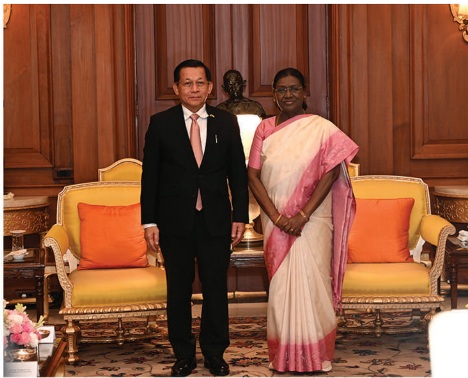
နိုင်ငံတော်သမ္မတ ဦးမင်းအောင်လှိုင်နှင့် အိန္ဒိယသမ္မတနိုင်ငံ သမ္မတ ဒရက်ပတီမာမူတို့ ဇွန် ၁ ရက်က သမ္မတအိမ်တော်၌ မှတ်တမ်းတင်ဓာတ်ပုံရိုက်စဉ်။

မိမိတို့ နိုင်ငံတော်သမ္မတကြီးအနေနဲ့ အခုလို