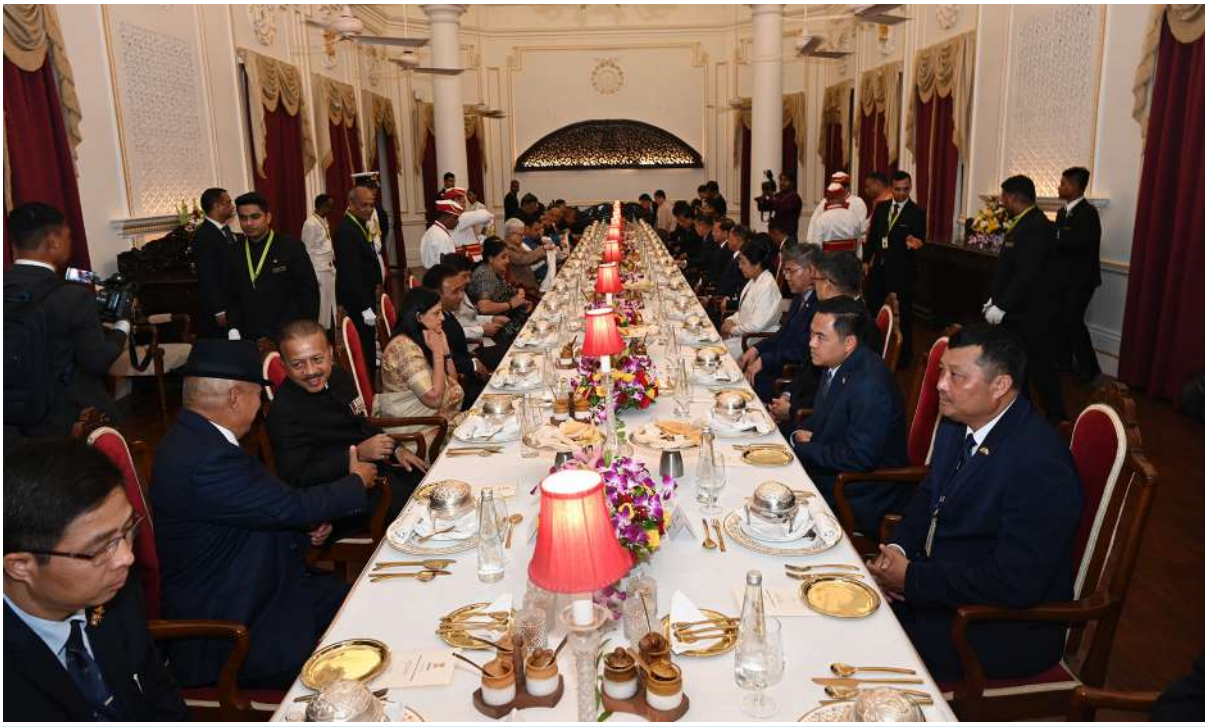
ပြည်ထောင်စုသမ္မတမြန်မာနိုင်ငံတော် နိုင်ငံတော်သမ္မတ ဦးမင်းအောင်လှိုင်အား မဟာရာရှ်ထရာပြည်နယ်အုပ်ချုပ်ရေးမှူးက ဂုဏ်ပြုညစာဖြင့် တည်ခင်းဧည့်ခံစဉ်။

ထိုသို့တွေ့ဆုံဆွေးနွေးရာတွင် နှစ်နိုင်ငံ အိမ်နီးချင်းကောင်း နိုင်ငံများဖြစ်သည်နှင့် အညီ သမိုင်းကြောင်းတစ်လျှောက်ကောင်း မွန်သည့်ဆက်ဆံရေးများရှိခဲ့မှုနှင့် ချစ်ကြည်ရင်းနှီးမှုနှင့် ပူးပေါင်းဆောင်ရွက်မှုများ