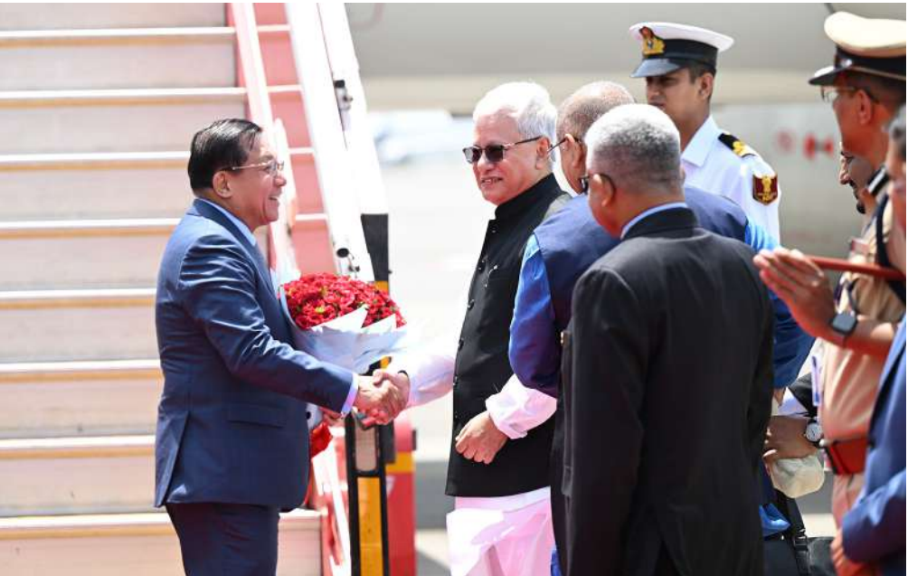
ပြည်ထောင်စုသမ္မတမြန်မာနိုင်ငံတော် နိုင်ငံတော်သမ္မတ ဦးမင်းအောင်လှိုင်အား မဟာရာရှ်ထရာပြည်နယ် အုပ်ချုပ်ရေးမှူး Shri. Jishnu Dev နှင့် ပြည်နယ်အစိုးရအဖွဲ့မှ တာဝန်ရှိသူများ၊ ကိုယ်ကတ္တားမြို့ မြန်မာကောင်စစ် ဝန်ချုပ်နှင့် ဝန်ထမ်းမိသားစုများက မွမ်ဘိုင်းမြို့ Chhatrapati Shivaji Maharaj အပြည်ပြည်ဆိုင်ရာလေဆိပ်၌ ကြိုဆိုနှုတ်ဆက်စဉ်။