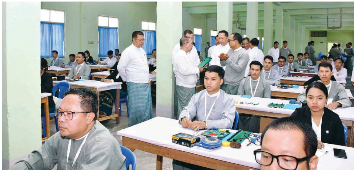
ပြည်ထောင်စုရွေးကောက်ပွဲကော်မရှင်ရုံး ကော်မရှင်အဖွဲ့ခွဲရုံး အဆင့်ဆင့်တို့မှ တာဝန်ရှိသူများနှင့် တိုင်းဒေသကြီး၊ ပြည် နယ်၊ ပြည်ထောင်စုနယ်မြေရွေးကောက်ပွဲ ကော်မရှင်အဖွဲ့ခွဲရုံး သင်တန်းသား၊ သင်တန်းသူ ဦးရေ ၁၀၀ တက်ရောက်ခဲ့ကြပြီး သင်တန်းကို ဇွန် ၂ ရက်မှ ၂၆ ရက်ထိ ဖွင့်လှစ်ပို့ချသွားမည် ဖြစ်ကြောင်း သတင်းရရှိသည်။ (သတင်းစဉ်)

ကန့်သတ်ပစ္စည်းများ ဖြစ်သည့်အတွက် ထားသိုထိန်းသိမ်းရာတွင် လုံခြုံမှုရှိရန်၊ သဘာဝဘေး အန္တရာယ်ကြောင့်ဖြစ်စေ အကြောင်းအမျိုးမျိုးကြောင့်ဖြစ်စေ ပျက်စီး ထိခိုက်မှုမဖြစ်အောင် စနစ်တကျထားသို ထိန်းသိမ်းကြရန်၊ ခြောက်လတစ်ကြိမ် စဉ်ဆက်မပြတ် ပုံမှန်စစ်ဆေးခြင်းများကို အလေးထားဆောင်ရွက်ကြရန် ပြောကြား သည်။ ထို့နောက် ပြည်ထောင်စုရွေးကောက် ပွဲကော်မရှင်ဥက္ကဋ္ဌနှင့် အဖွဲ့ဝင်များသည် မြန်မာအိလက်ထရောနစ် မဲပေးစက် (MEVM) ပြင်ဆင်ထိန်းသိမ်းခြင်း သင်တန်း သင်တန်းပို့ချနေမှုကို ကြည့်ရှု သည်။ အဆိုပါသင်တန်းဖွင့်ပွဲသို့ ပြည်ထောင်စု ရွေးကောက်ပွဲကော်မရှင် အဖွဲ့ဝင်များ၊