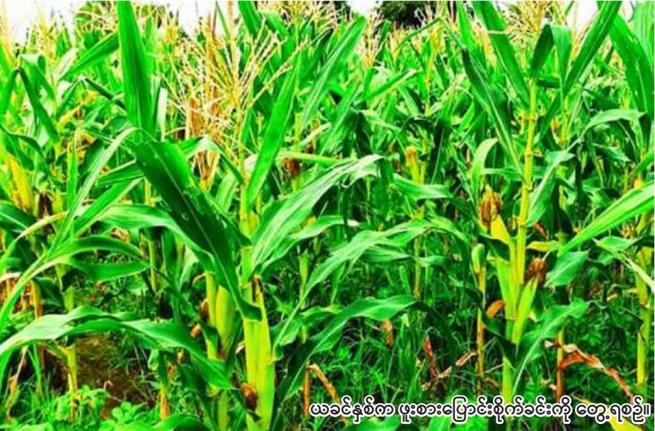
ယခင်နှစ်က ဖူးစားပြောင်းစိုက်ခင်းကို တွေ့ရစဉ်။