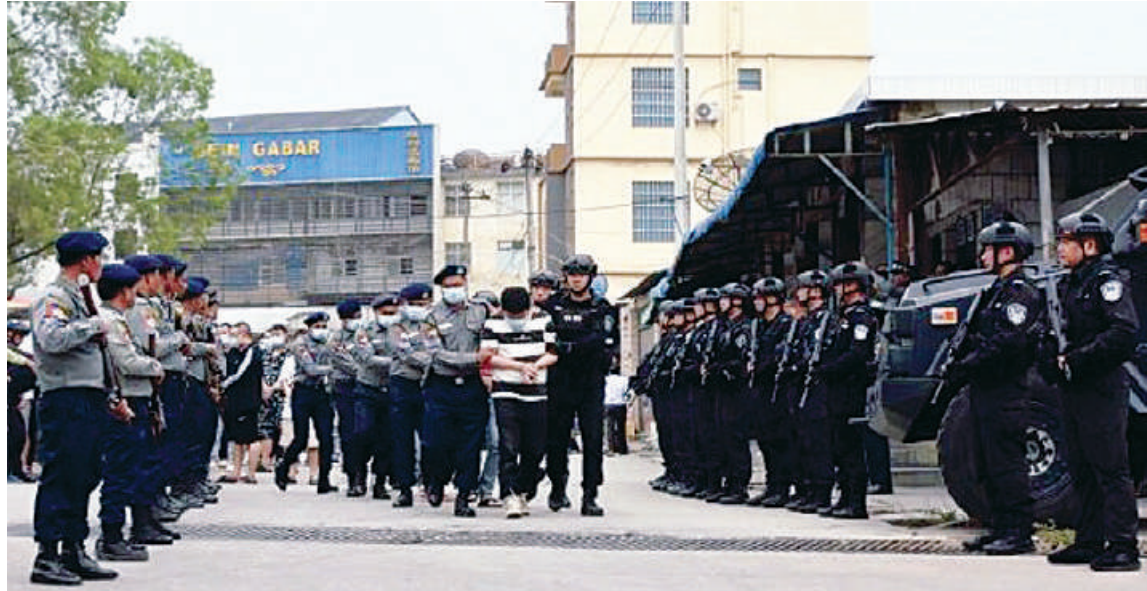
ရှမ်းပြည်နယ် မူဆယ်မြို့နယ်၌ အွန်လိုင်းလိမ်လည်မှုနှင့် အွန်လိုင်းလောင်းကစားမှုမှ ဖမ်းဆီးရမိသည့် နိုင်ငံခြားသားများအား ပြည်နှင့်လွှဲပြောင်းပေးအပ်မှုမှတ်တမ်းဓာတ်ပုံ။

ခြင်း၊ စက်ယန္တရားများအသုံးပြု၍ ဖြိုချဖျက်ဆီးခြင်းများ ဆောင်ရွက်ခဲ့ရာ အပိုင်း(၁)တွင် အဆောက်အအုံ ၁၄၇ လုံး ကို ၂၀၂၅ ခုနှစ် အောက်တိုဘာ ၂၃ ရက်မှ နိုဝင်ဘာ ၁၉ ရက်ထိလည်းကောင်း၊ အပိုင်း(၂)တွင် အဆောက်အအုံ ၆၂ လုံးကို ၂၀၂၆ ခုနှစ် ဇန်နဝါရီ ၁ ရက်မှ ၈ ရက်ထိ လည်းကောင်း၊ အပိုင်း(၃)တွင် အဆောက်အအုံ ၄၂၅ လုံးကို ၂၀၂၅ ခုနှစ် နိုဝင်ဘာ ၁၇ ရက်မှ ၂၀၂၆ ခုနှစ် ဇန်နဝါရီ ၆ ရက်ထိလည်းကောင်း ဖျက်ဆီးခဲ့သည်။ ထို့အတူ မြဝတီခရိုင် ရွှေကုက္ကိုလ် ကျေးရွာ၌ အွန်လိုင်းလောင်းကစားလုပ် ကိုင်ရန် တရားမဝင်ဆောက်လုပ်ထား