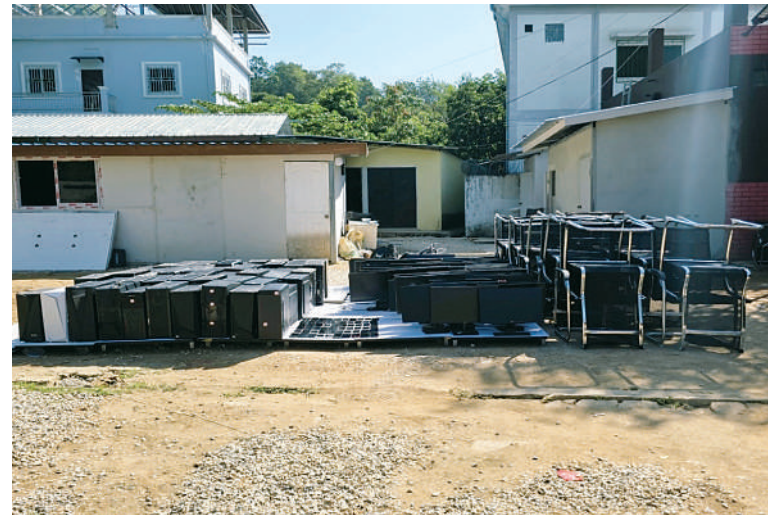
တာချီလိတ်မြို့အနီး ဝမ်လုံးကျေးရွာ၌ အွန်လိုင်းလိမ်လည်လောင်းကစားမှု လုပ်ငန်းလုပ်ကိုင်သည့် ဆက်စပ်ပစ္စည်းများကို တွေ့မြင်ရပုံ။

လုပ်ထုံးလုပ်နည်းများနှင့်အညီ ဆက်လက်ဆောင်ရွက်သွားမည် ဖြစ်ကြောင်း သိရသည်။ နိုင်ငံတော်အနေဖြင့် အွန်လိုင်းလိမ်လည် လောင်းကစားမှုကျူးလွန်ခြင်းများ ပပျောက်စေရေးနှင့် မြန်မာနိုင်ငံအတွင်း အခြေချလုပ်ကိုင်နိုင်မှုမရှိစေရေးအတွက် အိမ်နီးချင်းနိုင်ငံများ၊ ဒေသတွင်းနိုင်ငံများ၊ နိုင်ငံတကာအဖွဲ့အစည်းများနှင့်ပူးပေါင်း၍ အွန်လိုင်းလိမ်လည်လောင်းကစားမှုတိုက်ဖျက်ရေးလုပ်ငန်းစဉ်များကို တက်ကြွစွာ ဆက်လက်ဆောင်ရွက်လျက်ရှိကြောင်း သတင်းရရှိသည်။ (၅၀၁)