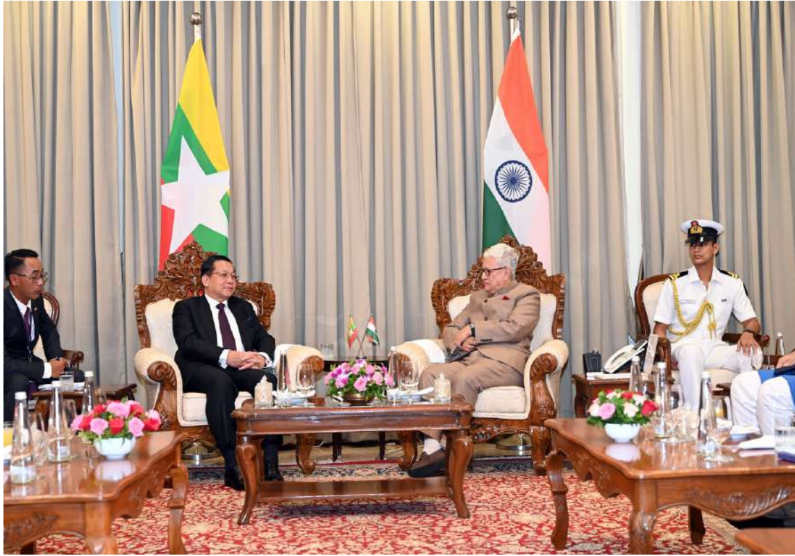
President U Min Aung Hlaing holds talks with Governor of Maharashtra State Shri. Jishnu Dev Verma.

Nay Pyi Taw June 2 President of the Republic of the Union of Myanmar U Min Aung Hlaing who was on an official visit to Mumbai, India, held talks with Governor of Maharashtra State Shri. Jishnu Dev Verma this evening.