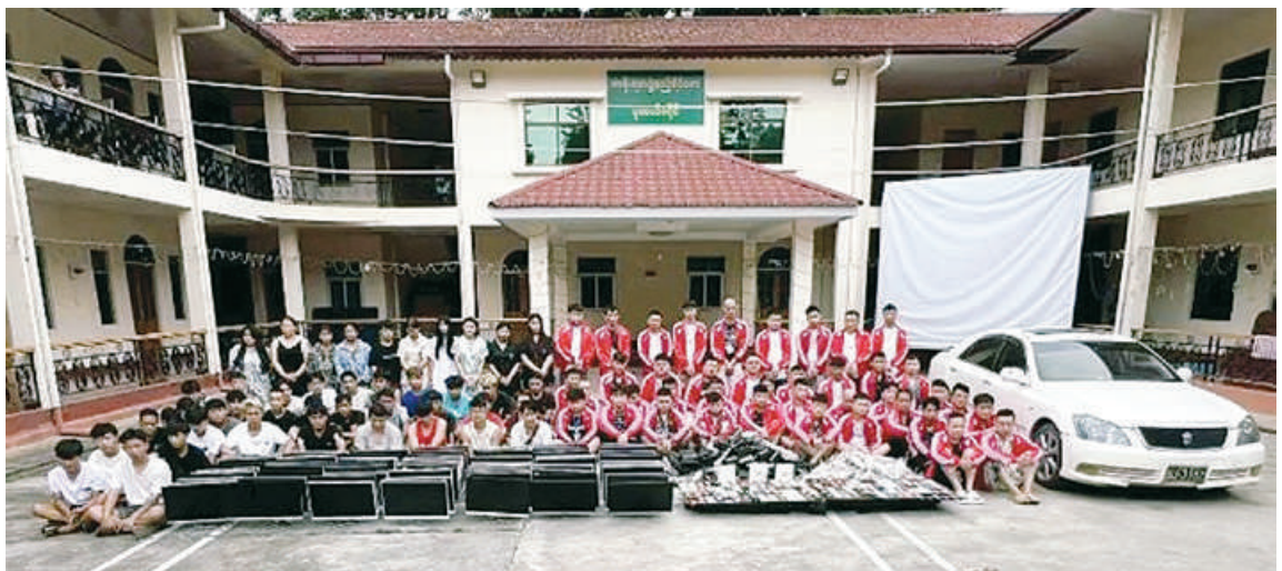
(၁၆-၆-၂၀၂၅)ရက်နေ့တွင် ရှမ်းပြည်နယ် မူဆယ်မြို့နယ်၌ တရားမဝင် Online ငွေကြေးလိမ်လည်လုပ်ငန်းလုပ်ကိုင်သူ မြန်မာနိုင်ငံသား ၉၇ ဦး၊ တရုတ်နိုင်ငံသား ၄၁ ဦးတို့ကို သက်သေခံပစ္စည်းများနှင့်အတူ ဖော်ထုတ်ဖမ်းဆီးရမိမှုမှတ်တမ်းဓာတ်ပုံ။

ဒီဇင်ဘာ ၃၁ ရက်ထိ ရန်ကုန်တိုင်းဒေသကြီးနှင့် ရှမ်းပြည်နယ်တို့၌ အမှုပေါင်း ၁၅ မှု မြန်မာနိုင်ငံသား အမျိုးသား ၄၉ ဦး၊ အမျိုးသမီး ၆၃ ဦး၊ နိုင်ငံခြားသား အမျိုးသား ၃၃၁ ဦး၊ အမျိုးသမီး ၃၂၇ ဦး၊ နိုင်ငံခြားသား အမျိုးသား ၇၆၁ ဦး၊ အမျိုးသမီး ၂၆ ဦးတို့ကိုလည်းကောင်း။ ၂၀၂၄ ခုနှစ် ဇန်နဝါရီ ၁ ရက်မှ ဒီဇင်ဘာ ၃၁ ရက်ထိ မန္တလေးတိုင်းဒေသကြီး၊ ရန်ကုန်တိုင်းဒေသကြီး၊ ရှမ်းပြည်နယ်တို့၌ အမှုပေါင်း ၆၆ မှု မြန်မာနိုင်ငံသား အမျိုးသား ၄၃၁ ဦး၊ အမျိုးသမီး ၃၂၇ ဦး၊ နိုင်ငံခြားသား အမျိုးသား ၇၆၁ ဦး၊ အမျိုးသမီး ၂၆ ဦးတို့ကိုလည်းကောင်း။ ၂၀၂၅ ခုနှစ် ဇန်နဝါရီ ၁ ရက်မှ ဒီဇင်ဘာ ၃၁ ရက်ထိ မန္တလေးတိုင်းဒေသကြီး၊ ရန်ကုန်တိုင်းဒေသကြီး၊