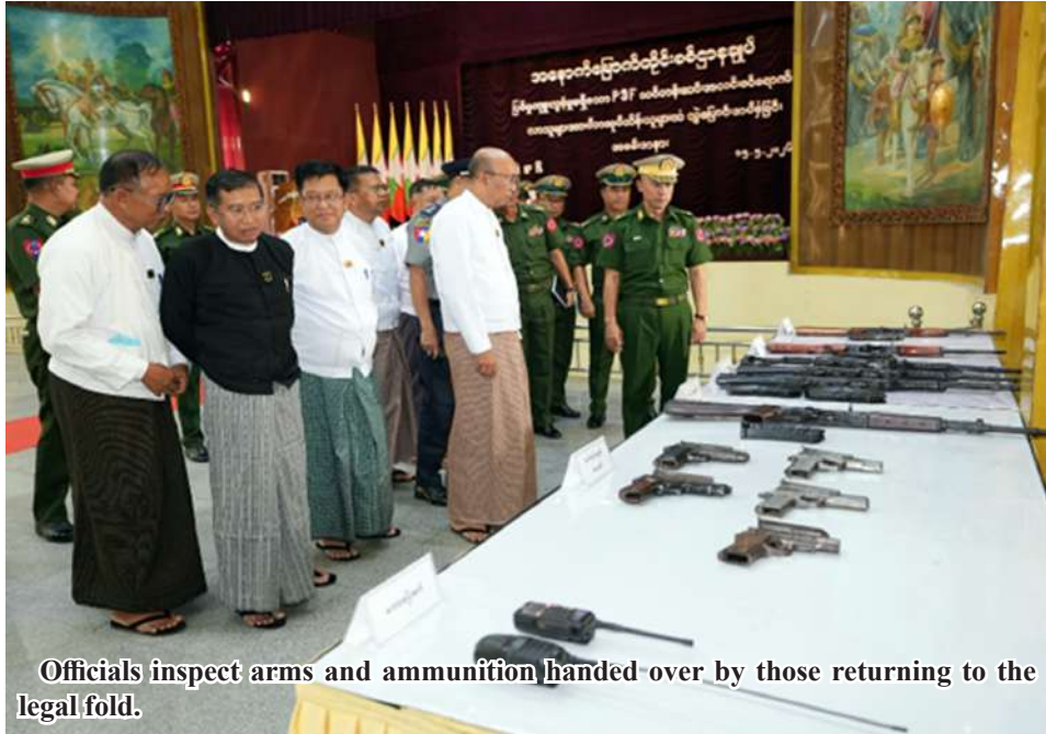
Officials inspect arms and ammunition handed over by those returning to the legal fold.