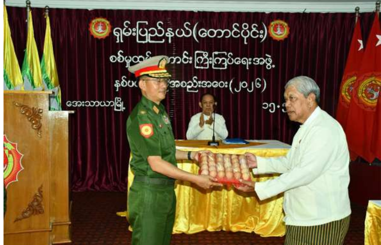
အရှေ့ပိုင်းတိုင်းစစ်ဌာနချုပ် တိုင်းမှူး ဗိုလ်မှူးချုပ်ကျော်နိုင်ဦး စစ်မှုထမ်းဟောင်း အဖွဲ့ဝင်များအတွက် ဂုဏ်ပြုချီးမြှင့်ငွေနှင့် အာဟာရဖြည့်စားသောက်ဖွယ်ရာများ ပေးအပ်စဉ်။

ဟောင်းအဖွဲ့ ဗဟိုအမှုဆောင်အဖွဲ့ဥက္ကဋ္ဌ နှင့် တိုင်းမှူးတို့က စစ်မှုထမ်းဟောင်း အဖွဲ့ဝင်များကို ဂုဏ်ပြုချီးမြှင့်ငွေနှင့် အာဟာရဖြည့် စားသောက်ဖွယ်ရာများ ပေးအပ်ရာ တာဝန်ရှိသူများက လက်ခံရယူ ကြသည်။ ဆက်လက်၍ စစ်မှုထမ်းဟောင်း အဖွဲ့ဝင်များကို နယ်မြေခံတပ်မတော် ဆေးရုံမှ ဆေးကုသရေးအဖွဲ့က ကျန်းမာ ရေးစောင့်ရှောက်မှုလုပ်ငန်းများ ဆောင်ရွက် ပေးရာ မြန်မာနိုင်ငံစစ်မှုထမ်းဟောင်းအဖွဲ့ ဗဟိုအမှုဆောင်အဖွဲ့ဥက္ကဋ္ဌ၊ တိုင်းမှူးနှင့် တာဝန်ရှိသူများက လိုက်လံကြည့်ရှု အားပေးကြပြီး စစ်မှုထမ်းဟောင်းအဖွဲ့ဝင် များကို ရင်းရင်းနှီးနှီးလိုက်လံနှုတ်ဆက်ခဲ့ ကြကြောင်း သတင်းရရှိသည်။ (၅၀၁)