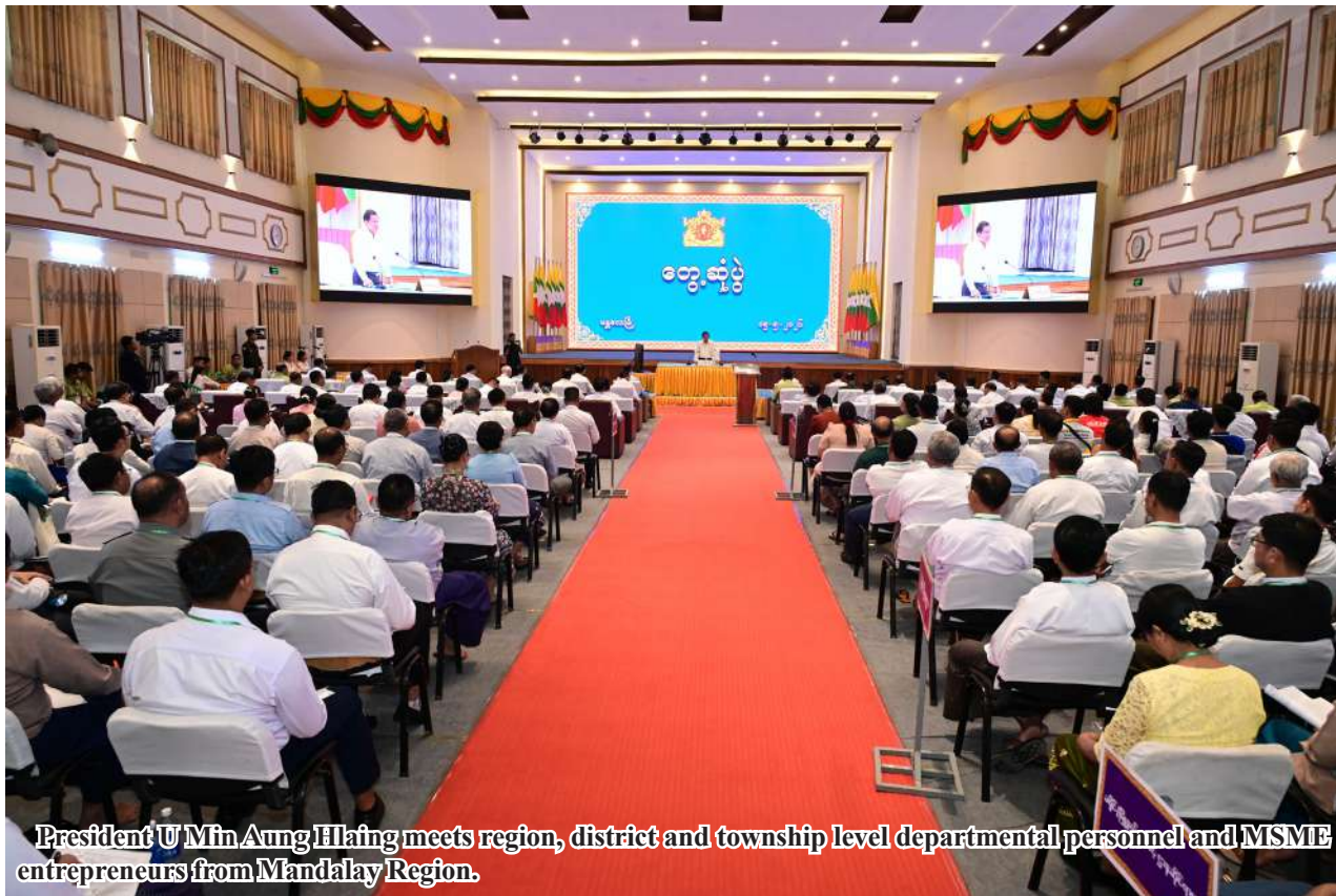
President U Min Aung Hlaing meets region, district and township level departmental personnel and MSME entrepreneurs from Mandalay Region.