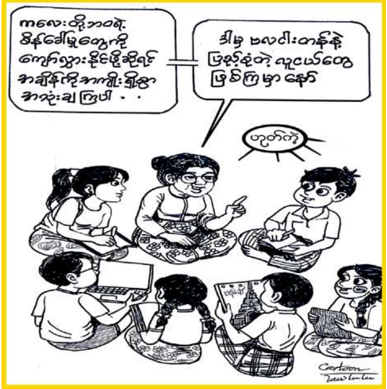
ကလေးတို့ဘဝနဲ့ ဝိန်ခေါ်မှုတွေကို ကျော်လွှားနိုင်ဖို့ဆိုရင် အချိန်ကိုအကျိုးရှိစွာ အသုံးပြုကြပါ . .