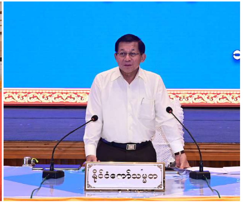
ပြည်ထောင်စုသမ္မတမြန်မာနိုင်ငံတော် နိုင်ငံတော်သမ္မတ ဦးမင်းအောင်လှိုင် မန္တလေးတိုင်းဒေသကြီးအတွင်းရှိ တိုင်းဒေသကြီး၊ ခရိုင်၊ မြို့နယ်အဆင့် ဌာနဆိုင်ရာ တာဝန်ရှိသူများ၊ အသေးစား၊ အငယ်စားနှင့် အလတ်စား စီးပွားရေး(MSME)လုပ်ငန်းရှင်များနှင့်တွေ့ဆုံ၍ ဒေသဖွံ့ဖြိုးတိုးတက်ရေးဆိုင်ရာများ ဆွေးနွေးပြောကြားစဉ်။

ရှေ့ဖုံးမှအဆက် ဦးမြထွန်းဦး၊ ဦးတင်ဦးလွင်၊ ဦးမင်းနောင်၊ ဦးမျိုးဇော်သိမ်း၊ ဦးဆန်းဦးနှင့် ဦးမျိုးသန့်၊ မန္တလေးတိုင်းဒေသကြီး ဝန်ကြီးချုပ် ဦးမျိုးအောင်၊ တိုင်းဒေသကြီးလွှတ်တော် ဥက္ကဋ္ဌ၊ တိုင်းဒေသကြီးတရားသူကြီးချုပ်၊ ကာကွယ်ရေးဦးစီးချုပ်ရုံးမှ အဆင့်မြင့် တပ်မတော်အရာရှိကြီးများ၊ အလယ်ပိုင်း တိုင်းစစ်ဌာနချုပ် တိုင်းမှူး၊ ဒုတိယဝန်ကြီးများ၊ တိုင်းဒေသကြီးလွှတ်တော် ဒုတိယဥက္ကဋ္ဌ၊ တိုင်းဒေသကြီးဝန်ကြီးများ၊ တိုင်းဒေသကြီး၊ ခရိုင်၊ မြို့နယ်အဆင့်ဌာန ဆိုင်ရာတာဝန်ရှိသူ များ၊ အသေးစား၊ အငယ်စားနှင့် အလတ်စား စီးပွားရေး(MSME)လုပ်ငန်းရှင်များနှင့်တာဝန် ရှိသူများ တက်ရောက်ကြသည်။