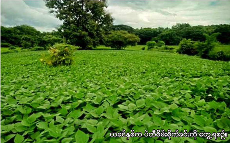
ယခင်နှစ်က ပဲတီစိမ်းစိုက်ခင်းကို တွေ့ရစဉ်။

မုံရွာ မေ ၁၅ စစ်ကိုင်းတိုင်းဒေသကြီး မုံရွာခရိုင် မုံရွာမြို့နယ်တွင် ယခုနှစ် မိုးသီးနှံစိုက်ပျိုးရာသီ၌ ပဲတီစိမ်းကေ ၁၀၃၀၀ စိုက်ပျိုးသွားမည်ဖြစ်ကြောင်း မုံရွာမြို့နယ် စိုက်ပျိုးရေးဦးစီးဌာနမှ သိရသည်။ မုံရွာမြို့နယ်တွင် မိုးသီးနှံစိုက်ပျိုးရာသီ၌ ပဲတီစိမ်းကေ