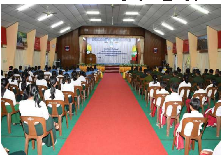
အနောက်တောင်တိုင်းစစ်ဌာနချုပ်၌ အင်္ဂလိပ်စာသင်တန်း၊ ကွန်ပျူတာသင်တန်း၊ မြန်မာ့သိုင်းသင်တန်းဆင်းပွဲ ကျင်းပစဉ်။

နေပြည်တော် မေ ၁၅ အနောက်တောင်တိုင်း စစ်ဌာနချုပ်ရှိ တပ်မတော်သားမိသားစုဝင်ကျောင်းသား၊ ကျောင်းသူများ နွေရာသီကျောင်းပိတ်ရက် အားလပ်ချိန်များကို အကျိုးရှိစွာ အသုံးပြု တတ်စေရန်နှင့် လက်တွေ့အသုံးပြုတာဝန် ရပ်များနှင့်အတူ ဗဟုသုတရရှိစေပြီး အတတ်ပညာများ တိုးပွားစေရန်ရည်ရွယ် ဖွင့်လှစ်ခဲ့သည့် နွေရာသီသင်တန်းများဖြစ် သည့် အင်္ဂလိပ်စာသင်တန်း၊ ကွန်ပျူတာ သင်တန်း၊ မြန်မာ့သိုင်းသင်တန်းများ ဆင်းပွဲကို ယနေ့တွင် တိုင်းစစ်ဌာနချုပ်ရှိ ဧရာဝတီခန်းမ၌ ပြုလုပ်ရာ တိုင်းမှူး ဗိုလ်မှူးချုပ်အောင်ကျော်ခိုင်နှင့် တာဝန် ရှိသူများ၊ အရာရှိ စစ်သည်၊ မိသားစုဝင်များ၊