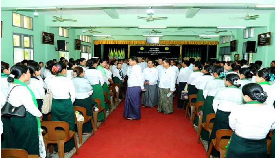
မန္တလေး မေ ၁၅ ပညာသင်တန်း