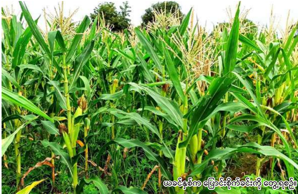
ဖွံ့ဖြိုးတိုးတက်မှု ဖြောင်းစိုက်ခင်းကို တွေ့ရစေခဲ့။

မုံရွာ မေ ၁၅ သီရိသည်။ စစ်ကိုင်းတိုင်းဒေသကြီး ယင်းမာပင်ခရိုင်တွင် ယခုနှစ် ယင်းမာပင်ခရိုင်တွင် ယခုနှစ် မိုးသီးနှံစိုက်ပျိုးရာသီ၌ ဖူးစား မိုးသီးနှံစိုက်ပျိုးရာသီ၌ ဖူးစား ပြောင်းစိုက်ပျိုးရန် မြို့နယ် ပြောင်း ၂၇၇၀၅ ဧက စိုက်ပျိုးမည် အလိုက် လျာထားမှုအနေဖြင့် ဖြစ်ကြောင်း စစ်ကိုင်းတိုင်းဒေသ ယင်းမာပင်မြို့နယ်တွင် ဧက ကြီး စိုက်ပျိုးရေးဦးစီးဌာနမှ ၁၁၅၀၀၊ ကန်မြို့နယ်တွင် ၂၁၅၆