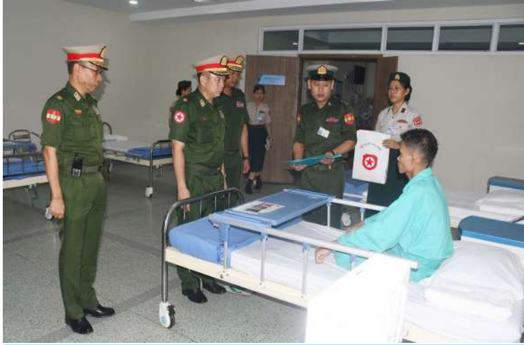
ရန်ကုန်တိုင်းစစ်ဌာနချုပ် တိုင်းမှူး ဗိုလ်မှူးချုပ်တင်မင်းလတ် ဆေးကုသမှုခံယူနေသူတစ်ဦးကို ရင်းရင်းနှီးနှီးမေးမြန်းအားပေးစကားပြောကြားစဉ်။

နေပြည်တော် မေ ၁၅ တပ်မတော်အနေဖြင့် တိုင်းရင်းသား ပြည်သူများ၏ ကျန်းမာရေးစောင့်ရှောက်မှု လုပ်ငန်းများတွင် နိုင်ငံတော်အစိုးရနှင့် အတူ တစ်ဖက်တစ်လမ်းမှ ကူညီစောင့်ရှောက်မှုများ ဆောင်ရွက်ပေးလျက်ရှိရာ တိုင်းဒေသကြီးနှင့် ပြည်နယ်အသီးသီးရှိ တပ်မတော်ဆေးရုံများ၌ အရာရှိ၊ စစ်သည်၊ မိသားစုများ၊ ပြည်သူ့စစ်မှုထမ်းများ၊ စစ်မှုထမ်းဟောင်းအဖွဲ့ဝင်များ၊ မြန်မာနိုင်ငံရဲ့ တပ်ဖွဲ့ဝင်များ၊ ပြည်သူ့စစ်(ဌာန) တပ်ဖွဲ့ဝင်များအပြင် သံဃာတော်များ၊ ဘာသာနာနွယ်ဝင်သီလရှင်များနှင့် ဒေသခံ တိုင်းရင်းသားပြည်သူများကိုလည်း လက်ခံဆေးကုသပေးခြင်းများ ဆောင်ရွက်ပေးလျက်ရှိသည်။