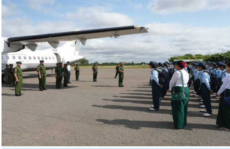
အနောက်မြောက်တိုင်းစစ်ဌာနချုပ် တိုင်းမှူး ဗိုလ်ချုပ်ကျော်သူရ နေပြည်တော်သို့ လေ့လာရေးခရီးသွားရောက်မည့် အခြေခံလေ့ကျင့်ရေးလူငယ် သင်တန်းသား၊ သင်တန်းသူများကို လေ့လာရေးခရီးထွက်ခွာစဉ်။

နေပြည်တော် မေ ၁၅ စစ်ကိုင်းဒေသကြီး မုံရွာမြို့နယ် မုံရွာသင်တန်းစခန်းရှိ အခြေခံလေ့ကျင့်ရေး လူငယ်သင်တန်းအမှတ်စဉ် (၁၀)မှ သင်တန်းသား၊ သင်တန်းသူများသည် ယနေ့နံနက်ပိုင်းတွင် နေပြည်တော်သို့ လေ့လာရေးခရီးသွားရောက်ရန်အတွက် မုံရွာလေဆိပ်မှ ထွက်ခွာကြသည်။