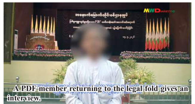
A PDF member returning to the legal fold gives an interview.