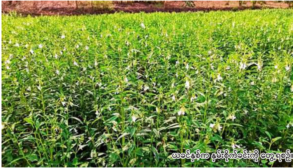
ယခင်နှစ်က နှမ်းစိုက်ခင်းကို တွေ့ရစဉ်

ဝက်လက် မေ ၁၅ စစ်ကိုင်းတိုင်းဒေသကြီး ရွှေဘိုခရိုင် ဝက်လက်မြို့နယ်တွင် ယခုနှစ် မိုးသီးနှံစိုက်ပျိုးရာသီ၌ နှမ်း ၁၆၀၇၅ ဧက စိုက်ပျိုးမည်ဖြစ်ကြောင်း ဝက်လက်မြို့နယ် စိုက်ပျိုးရေးဦးစီးဌာနမှ သိရသည်။ ဝက်လက်မြို့နယ်တွင် ယခုနှစ် မိုးသီးနှံစိုက်ပျိုးရာသီ၌ နှမ်း ၁၆၀၇၅ ဧက စိုက်ပျိုးရန်လျာထားပြီး လက်ရှိအချိန်တွင် နှမ်းများ စိုက်ပျိုးနိုင်ရေးအတွက် လယ်ယာ