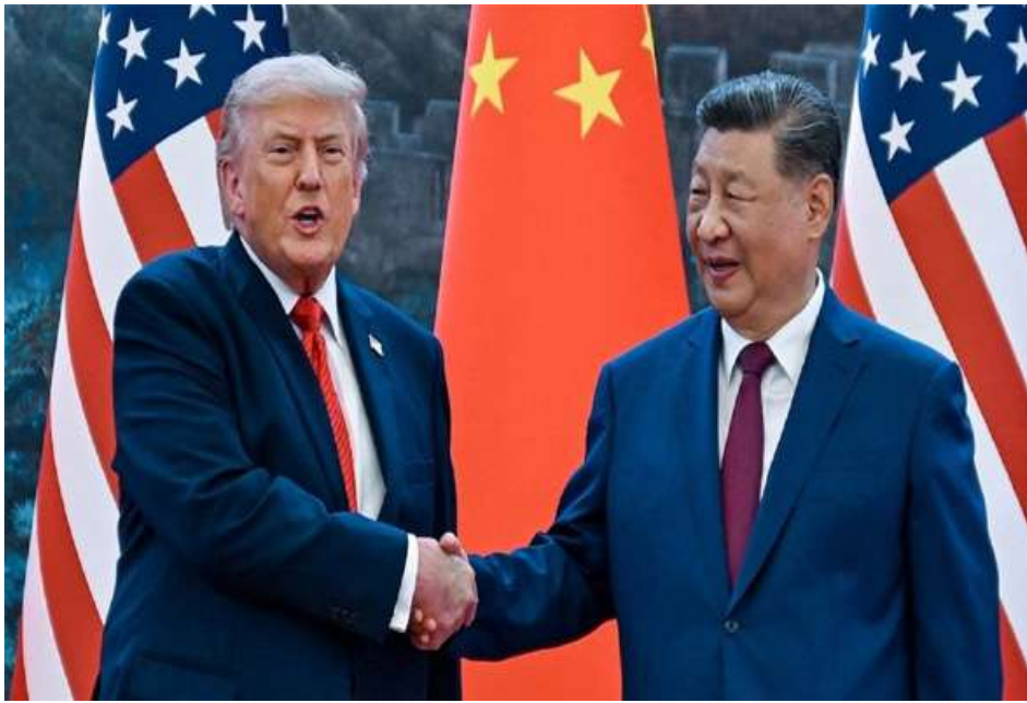
အမေရိကန်သမ္မတနှင့် တရုတ်သမ္မတတို့ကို တွေ့ရစဉ်။

ညှိနှိုင်းမှုဖွဲ့စည်းပုံ - အသွင်ပြောင်းခြင်းထက် အရောင်းအဝယ်ဝါဒ ( Transactionalism) South China Morning Post သတင်းစာ၏ လေ့လာသုံးသပ်မှုသည် ထိပ်သီးအစည်းအဝေး၏ မူလက အရောင်းအဝယ် သဘောသဘာဝကို မီးမောင်းထိုးပြလျက်ရှိသည်။ မူဝါဒဆိုင်ရာ