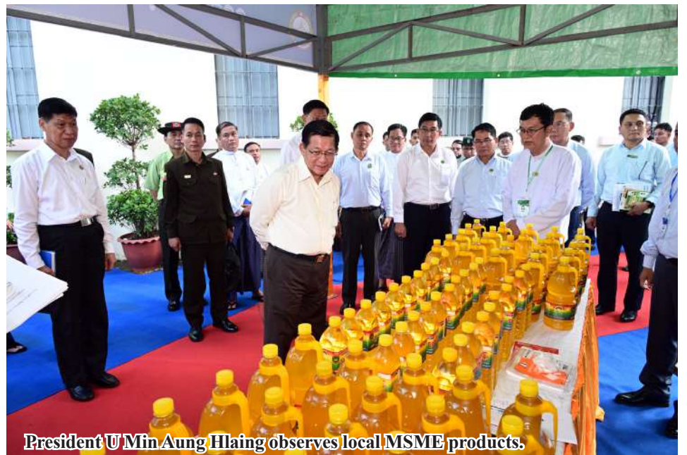
President U Min Aung Hlaing observes local MSME products.

In response, union ministers gave sector-wise clarifications. They explained the State's endeavours to erect