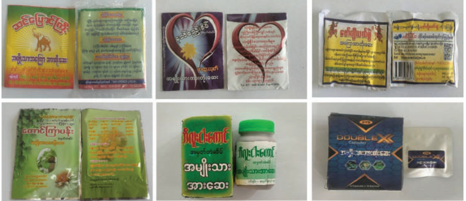
Sildenafil, Tadalafil ရောနှောသည့် ဆေးနမူနာများ။

၄။ တိုင်းရင်းဆေးဝါးထုတ်လုပ်ဖြန့်ဖြူးသည့် လုပ်ငန်းများနှင့် ဆေးဝါး ရောင်းချသည့် ဆေးဆိုင်များသည် တိုင်းရင်းဆေးပညာဦးစီးဌာနတွင် မှတ်ပုံတင်ထားခြင်းမရှိသော တိုင်းရင်းဆေးဝါးများ၊ ဆေးဝါးအတုများ၊ စံမညီ တိုင်းရင်းဆေးဝါးများ၊ အများပြည်သူသုံးစွဲရန်မသင့်ကြောင်း ကြေညာထားသည့် တိုင်းရင်းဆေးဝါးများ တင်သွင်းဖြန့်ဖြူးရောင်းချခြင်းများကို ကျင့်ဝတ်(Ethic)အရ လုံးဝ(လုံးဝ)မပြုလုပ်ရန်နှင့် လိုက်နာဆောင်ရွက် ခြင်းမရှိပါက တိုင်းရင်းဆေးဝါးဥပဒေပုဒ်မ(၃၁)၊ (၃၂)အရ တရားစွဲဆိုအရေးယူမည်ဖြစ်ကြောင်း အသိပေး အပ်ပါသည်။