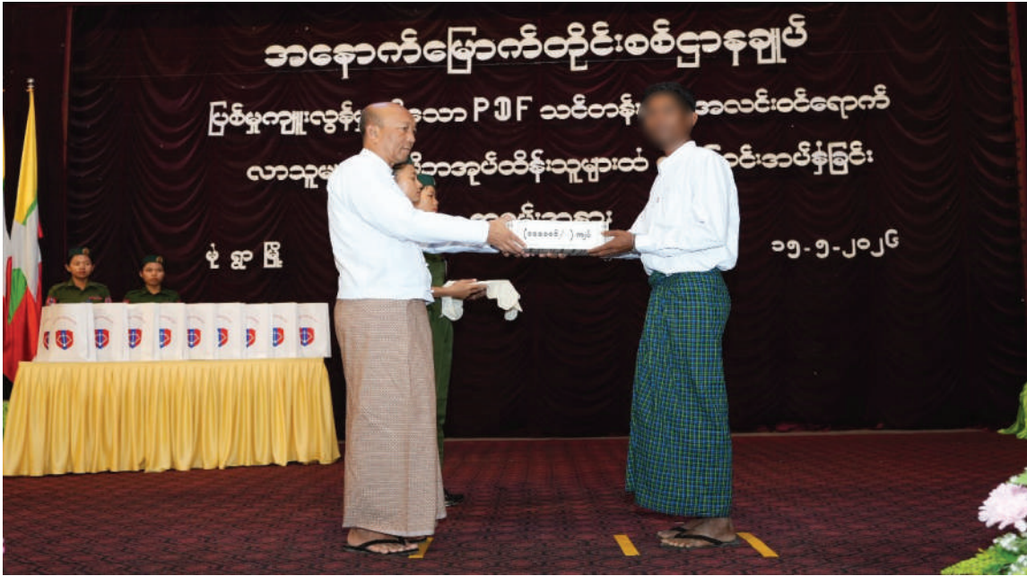
စစ်ကိုင်းတိုင်းဒေသကြီးဝန်ကြီးချုပ် ဦးကိုလေး ဥပဒေဘောင်အတွင်းဝင်ရောက်လာသူများကို ဆုကြေးငွေနှင့် စားသောက်ဖွယ်ရာများ ထောက်ပံ့ပေးအပ်စဉ်။

အဆိုပါ ဥပဒေဘောင်အတွင်း ဝင်ရောက်လာကြသူများကို သက်ဆိုင်ရာ တာဝန်ရှိသူများက ပစ္စည်းသေဆုတ် တစ်လက်အတွက် ဆုကြေးငွေကျပ်