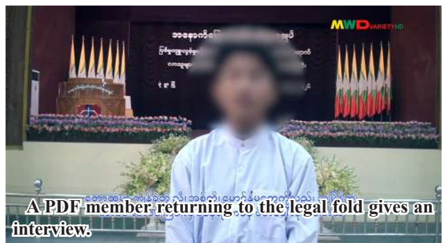
A PDF member returning to the legal fold gives an interview.

mines. When we returned after graduating from the training, I had to perform guard duty. During my time in this PDF terrorist group, they burned down villages they were dissatisfied with. As for women, they spared neither the young nor the old; if they liked them, they raped and killed them. They also arrested and beat the elders. They collected extortion money from the villages as well. The reason I considered surrendering now is that I know my actions were wrong. Having been away from my family for a long time, I want to live happily with my own family. That is why, as a young person, I surrendered because I want to live my life happily with my family and work decently for a living. When I surrendered, I was a little worried about whether it would be okay. However, it turned out to be completely different from what I had expected, and I am very grateful for the warm welcome and support. When I go back from here and am handed over to my parents, I will live with my parents and do a job decently. Therefore, I want to speak from this place to the brothers and sisters who want to surrender but have not had the opportunity within the PDF terrorist group. I want to urge you not to listen to misinformation and to know that when we surrendered, we were warmly welcomed and provided with support, which is our own firsthand experience. That is why I want to invite you from this place to surrender as soon as possible. 100