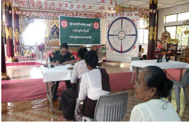
ရန်ကုန်တိုင်းစစ်ဌာနချုပ် နယ်လှည့်ဆေးကုသရေးအဖွဲ့က ဒေသခံပြည်သူများကို ကျန်းမာရေးစောင့်ရှောက်မှုလုပ်ငန်းများ ဆောင်ရွက်ပေးစဉ်။

နေပြည်တော် မေ ၁၅ ကူညီစောင့်ရှောက်မှုများ ဆောင်ရွက်ပေး တပ်မတော်အနေဖြင့် ပြည်သူလူထု၏ လျက်ရှိရာ ယနေ့နံနက်ပိုင်းတွင် ရန်ကုန် ကျန်းမာရေးကဏ္ဍ တိုးတက်မြှင့်တင်ရေး စတင်စစ်ဌာနချုပ် နယ်လှည့်ဆေးကုသရေး ရန်အတွက် ကျန်းမာရေးစောင့်ရှောက်မှု အဖွဲ့က ရန်ကုန်တိုင်းဒေသကြီး ခရမ်း လုပ်ငန်းများတွင် တစ်ဖက်တစ်လမ်းမှ မြို့နယ် အထက်ခမက်ကျေးရွာ အောင်