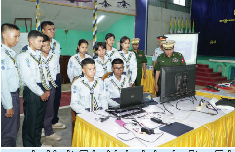
ကာကွယ်ရေးဦးစီးချုပ်ရုံး(ကြည်း)မှ ဗိုလ်ချုပ်ကျော်လင်းမောင် အခြေခံလေ့ကျင့်ရေး လူငယ်သင်တန်းသား၊ သင်တန်းသူများ လေ့ကျင့်သင်ကြားနေမှုကို ကြည့်ရှုအားပေးစဉ်။

နေပြည်တော် မေ ၁၅ သင်ကြားလေ့ကျင့်လျက်ရှိသည့် သင်တန်း တနင်္သာရီတိုင်းဒေသကြီး အတွင်းရှိ ကျောင်းသားလူငယ်များ နေရာသီကျောင်း ပိတ်ရက်ကာလအတွင်း အခြေခံလေ့ကျင့်ရေးဆိုင်ရာ ပညာရပ်များကို စိတ်ပါဝင်စားပြီး ကျွမ်းကျင်တတ်မြောက်စေရန်၊ ခေတ်မီနိုင်ငံတော်တည်ဆောက်ရေးတွင် လေ့လာပညာရပ်များကို နားလည်သိရှိစေရန်၊ စိတ်ဓာတ်၊ စည်းကမ်း၊ ကိုယ်လက်ကြံ့ခိုင်မှုနှင့် စည်းလုံးညီညွတ်မှုရှိစေရန်တို့ အတွက်ရည်ရွယ်၍ အခြေခံလေ့ကျင့်ရေး လူငယ်သင်တန်းအမှတ်စဉ်(၁၀)ကို ဧပြီ ၂၇ ရက်မှစတင်၍ မြိတ်မြို့ရှိ မြိတ်သင်တန်းစခန်း၌ လေ့ကျင့်သင်ကြားပေးလျက်ရှိသည်။