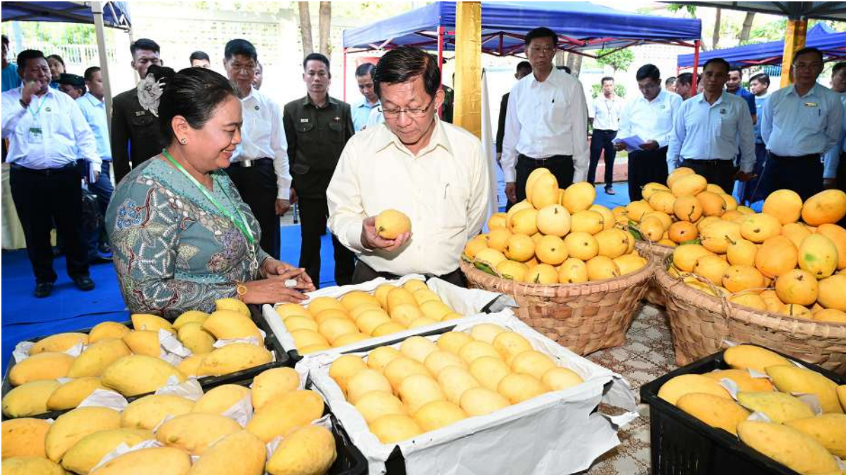
ပြည်ထောင်စုသမ္မတမြန်မာနိုင်ငံတော် နိုင်ငံတော်သမ္မတ ဦးမင်းအောင်လှိုင် ခင်းကျင်းပြသထားသည့် မန္တလေးတိုင်းဒေသကြီးအတွင်း ရှိ အသေးစား၊ အငယ်စားနှင့် အလတ်စားစီးပွားရေး (MSME) လုပ်ငန်းများမှထွက်ရှိသည့် ထုတ်ကုန်ပစ္စည်းများနှင့် ဒေသထွက်စားသောက် ကုန်များကို ပြခန်းတစ်ခုချင်းစီအလိုက် စိတ်ပါဝင်စားစွာဖြင့် လှည့်လည်ကြည့်ရှုစဉ်။

ရည်မှန်းချက်သီးနှံ ၁၀ မျိုးတွင် နှစ်စဉ်မြန်မာ ကျပ်ငွေ ၃၇၆၅ ဘီလီယံခန့် လျော့နည်း နှစ်နာဆုံးရှုံးရလျက်ရှိကြောင်း၊ တစ်နိုင်ငံ လုံးအတိုင်းအတာဖြင့် နှစ်စဉ် အမေရိကန် ဒေါ်လာ ရှစ်ဘီလီယံခန့် ထိခိုက်နှစ်နာဆုံးရှုံး ရလျက်ရှိကြောင်း၊ လက်ရှိစိုက်ပျိုးနေသည့် စိုက်ဧကအတိုင်း သီးထပ်စွမ်းအားပြည့်မီ အောင်စိုက်ပျိုးနိုင်မည်ဆိုပါက နှစ်စဉ် အမေရိကန် ဒေါ်လာ ဘီလီယံ ၂၀ ခန့် ပိုမို အကျိုးအမြတ်ရရှိနိုင်မည်ဖြစ်ကြောင်း၊ မိမိ တို့နိုင်ငံသည် စိုက်ပျိုးမွေးမြူရေးကို အခြေခံ သော စီးပွားရေးကိုဆောင်ရွက်သည့် နိုင်ငံ တစ်ခုဖြစ်သည့်အတွက် စိုက်ပျိုးရေးနှင့် မွေးမြူရေးလုပ်ငန်းများဖွံ့ဖြိုးတိုးတက်အောင် ဆောင်ရွက်သွားရမည်ဖြစ်ကြောင်း၊ ကမ္ဘာ ပေါ်ရှိ ဖွံ့ဖြိုးတိုးတက်ပြီး နိုင်ငံအများအပြား ဌာပင်စိုက်ပျိုးရေးလုပ်ငန်းများကို အလေးထား ဆောင်ရွက်နေရသဖြင့်ဖြစ်သည်ကို တွေ့မြင်ရ မည်ဖြစ်ကြောင်း၊ ဥပမာအားဖြင့် ကမ္ဘာ အင်အားကြီးနိုင်ငံတစ်နိုင်ငံဖြစ်သည့် အမေရိ ကန်နိုင်ငံသည်ပင်လျှင် စိုက်ပျိုးရေးထုတ်ကုန် များကိုထုတ်လုပ်၍ ပြည်ပနိုင်ငံများသို့ အများ အပြားတင်ပို့နေသည်ကို တွေ့မြင်ရမည်ဖြစ် ကြောင်း၊ ထို့ကြောင့် မိမိတို့အနေဖြင့် စိုက်ပျိုး မွေးမြူရေးကိုအခြေခံသည့် ကုန်ထုတ်လုပ်ငန်း (Agro-based Industries)၊ အသေးစား၊ အငယ်စားနှင့်အလတ်စားစီးပွားရေး (MSME) လုပ်ငန်းများကိုအားပေးမြှင့်တင်ခြင်းဖြင့် နိုင်ငံ စီးပွားဖွံ့ဖြိုးတိုးတက်အောင်ဆောင်ရွက်သွား ကြရမည်ဖြစ်ကြောင်း။