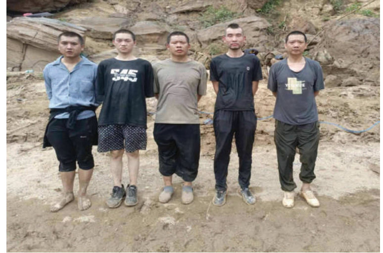
အွန်လိုင်းလိမ်လည်လောင်းကစားမှုကျူးလွန်ရာတွင် ပါဝင်ပတ်သက်ခဲ့သည့် တရုတ်နိုင်ငံသား ငါးဦးကို တွေ့ရစဉ်။

ဆောင်ရွက်လျက်ရှိသည့်အပြင် အကြောင်းအမျိုးမျိုးကြောင့် မြန်မာနိုင်ငံအတွင်းသို့ ရောက်ရှိနေပြီး အွန်လိုင်းလိမ်လည်လောင်းကစားမှုတွင် တစ်နည်းနည်းဖြင့် ပါဝင်ပတ်သက်နေသည့် ပြည်ပနိုင်ငံသားများကိုလည်း တရားဥပဒေနှင့်အညီ စစ်ဆေးကာ လူသားချင်းစာနာထောက်ထားမှုနှင့် နိုင်ငံအချင်းချင်း ချစ်ကြည်ရင်းနှီးမှုတို့ကိုရှေးရှု၍ သက်ဆိုင်ရာနိုင်ငံများသို့ ပြန်လည်လွှဲပြောင်းပေးခြင်းများ၊ အဓိကပြစ်မှု ကျူးလွန်သူများကိုလည်း ဖမ်းဆီးထိန်းသိမ်းပြီး သက်ဆိုင်ရာအစိုးရအဖွဲ့ထံ တရားဝင်လွှဲပြောင်းပေးခြင်းများနှင့် တရားဥပဒေနှင့်အညီ ထိရောက်စွာ အရေးယူခြင်းများ ဆောင်ရွက်လျက်ရှိကြောင်း သတင်းရရှိသည်။ (၅၀၁)