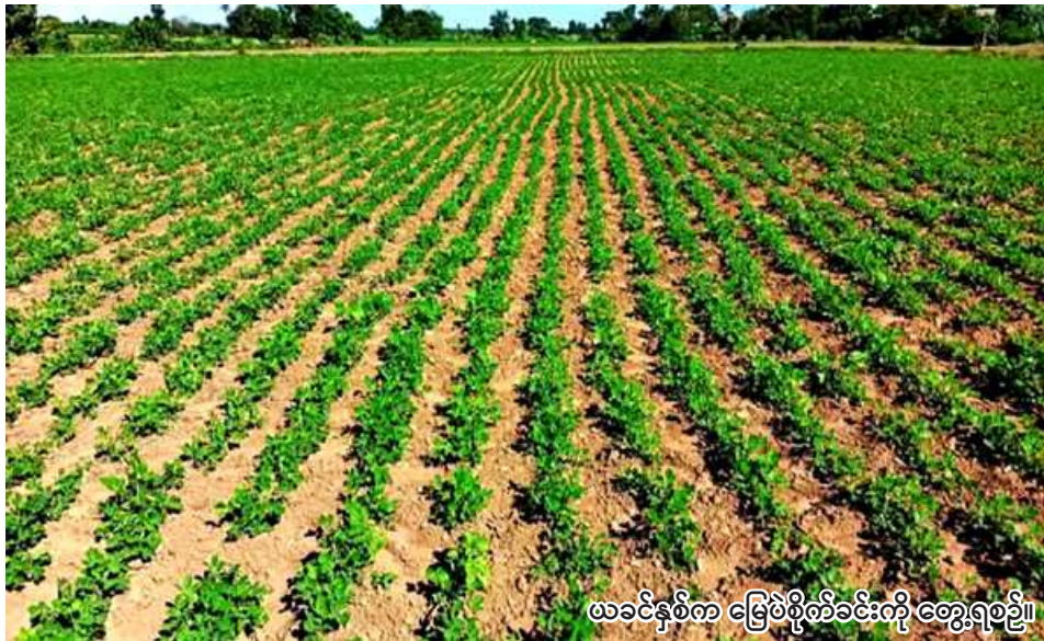
ယခုနှစ်က မြေပဲစိုက်ခင်းကို တွေ့ရစဉ်။

ကန့်ဘလူ မေ ၁၅ - ယခုနှစ် မိုးသီးနှံစိုက်ပျိုးရာသီ စစ်ကိုင်းတိုင်းဒေသကြီး တွင် ကန့်ဘလူမြို့နယ်မှာ မြေပဲ ၅၁၉၀၁ ဧက စိုက်ပျိုးရန်လျာထားပြီး အဆိုပါမြေပဲများ စိုက်ပျိုးမှုကို မြေပဲ ၅၁၉၀၁ ဧက စိုက်ပျိုးမည် ဖြစ်ကြောင်း ကန့်ဘလူမြို့နယ် စိုက်ပျိုးရေးဦးစီးဌာနမှ သိရသည်။ ယခုနှစ် မိုးသီးနှံစိုက်ပျိုးရာသီ ၅၁၉၀၁ ဧက စိုက်ပျိုးရန်လျာထားပြီး အဆိုပါမြေပဲများ စိုက်ပျိုးမှုကို မြေပဲ ၅၁၉၀၁ ဧက စိုက်ပျိုးမည် ဖြစ်ကြောင်း ကန့်ဘလူမြို့နယ် စိုက်ပျိုးရေးဦးစီးဌာနမှ သိရသည်။