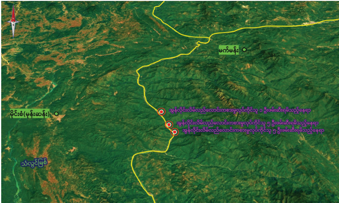
ရှမ်းပြည်နယ်(မြောက်ပိုင်း) မက်မန်းမြို့နယ်အတွင်း အွန်လိုင်းလိမ်လည်လောင်းကစားမှုကျူးလွန်ပြီး ထွက်ပြေးတိမ်းရှောင်နေသည့် တရားမဝင် တရုတ်နိုင်ငံသားများ ဖမ်းဆီးရမိသည့် ဖြစ်စဉ်နေရာပြမြေပုံ။

နေပြည်တော် မေ ၁၅ ရှမ်းပြည်နယ်(မြောက်ပိုင်း) မက်မန်းမြို့နယ်အတွင်းရှိ သံလွင်မြစ်အရှေ့ဘက်ကမ်းတစ်လျှောက်၌ အွန်လိုင်းလိမ်လည်လောင်းကစားမှုများ လုပ်ကိုင်နေကြောင်းနှင့် တရားမဝင်ပြည်ပနိုင်ငံသားများလည်း ရှိနေကြောင်း သတင်းများအရ ဌာနဆိုင်ရာ တာဝန်ရှိသူများပါဝင်သော ပူးပေါင်းအဖွဲ့များက ရှာဖွေစစ်ဆေးမှုများကို အင်တိုက်အားတိုက် ဆောင်ရွက်လျက်ရှိရာ ယနေ့တွင်လည်း အွန်လိုင်းလိမ်လည် လောင်းကစားမှုလုပ်ငန်းများ