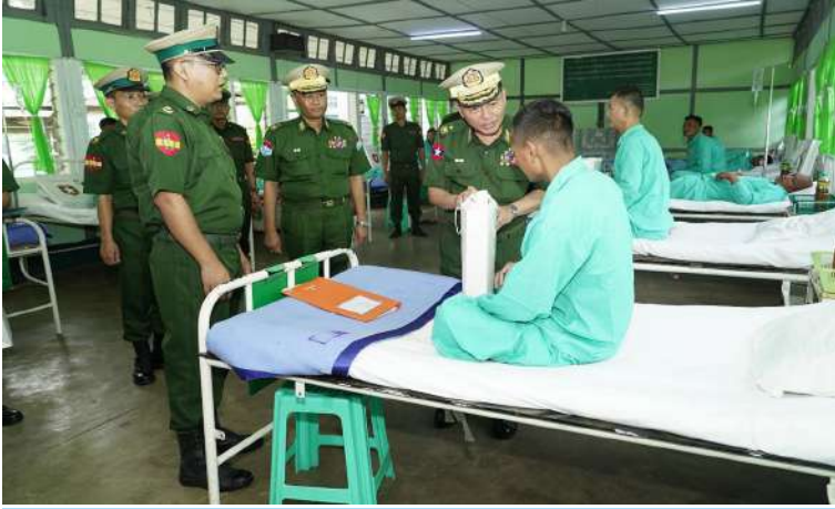
ကာကွယ်ရေးဦးစီးချုပ်ရုံး(ကြည်း)မှ ဗိုလ်ချုပ်ကျော်လင်းမောင် ဆေးကုသမှုခံယူနေသူတစ်ဦးကို ရင်းရင်းနှီးနှီးမေးမြန်းအားပေးစကားပြောကြားပြီး အာဟာရဖြည့်စားသောက်ဖွယ်ရာများ ပေးအပ်စဉ်။