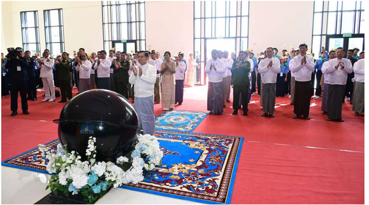
ပြည်ထောင်စုသမ္မတမြန်မာနိုင်ငံတော် နိုင်ငံတော်သမ္မတ ဦးမင်းအောင်လှိုင် “နိုင်ငံတော်သစ်၏ စွမ်းအားရှင်များ”အစီအစဉ်ကို စက်ခလုတ်နှိပ်ဖွင့်လှစ်ပေးစဉ်။

၂၀ ရှေးဖုံးမှအဆက် အဆင့်မြင့် တပ်မတော်အရာရှိကြီးများ၊ နေပြည်တော်တိုင်းစစ်ဌာနချုပ် တိုင်းမှူး၊ ဒုတိယဝန်ကြီးများ၊ ပညာရေးဝန်ကြီးဌာနမှ တာဝန်ရှိသူများ၊ အခြေခံပညာကျောင်းများမှ ဆရာ၊ ဆရာမများနှင့် ၂၀၂၅-၂၀၂၆ ပညာသင်နှစ် လူရည်ချွန်မောင်မယ်များ၊ ရေကြောင်းလူငယ်နှင့် လေကြောင်းလူငယ်များတက်ရောက်ကြသည်။