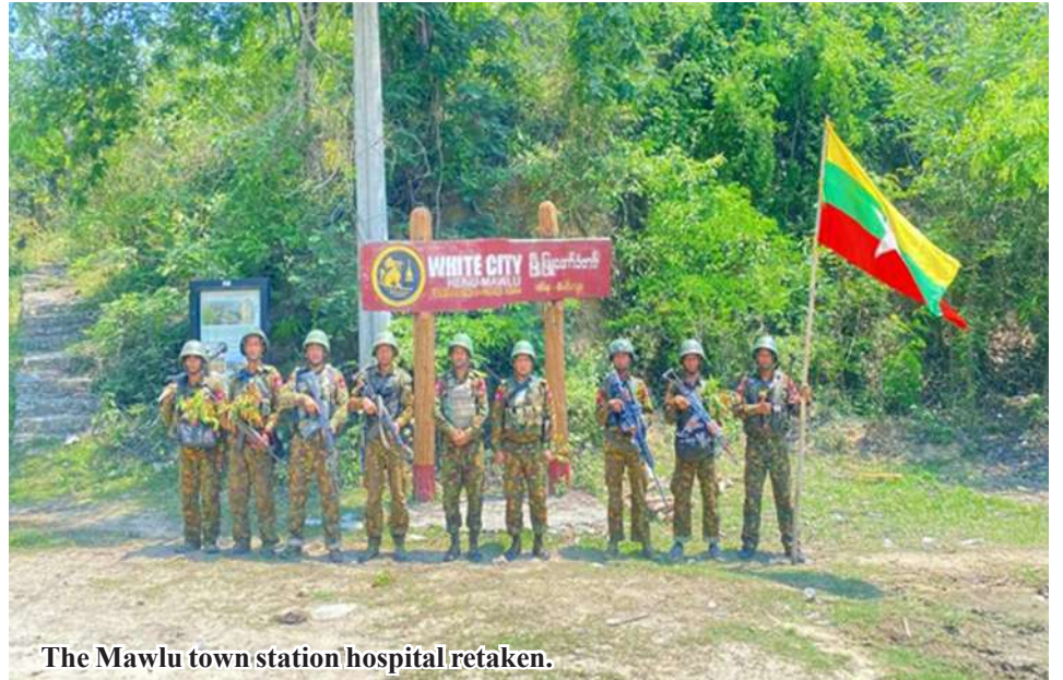
The Mawlu town station hospital retaken.