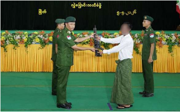
ကမ်းရိုးတန်းဒေသတိုင်းစစ်ဌာနချုပ် တိုင်းမှူး ဗိုလ်ချုပ်ကျော်ကျော်ဟန်ထံ PDF အမည်ခံအဖွဲ့ဝင်တစ်ဦးက လက်နက်အပ်နှံစဉ်။