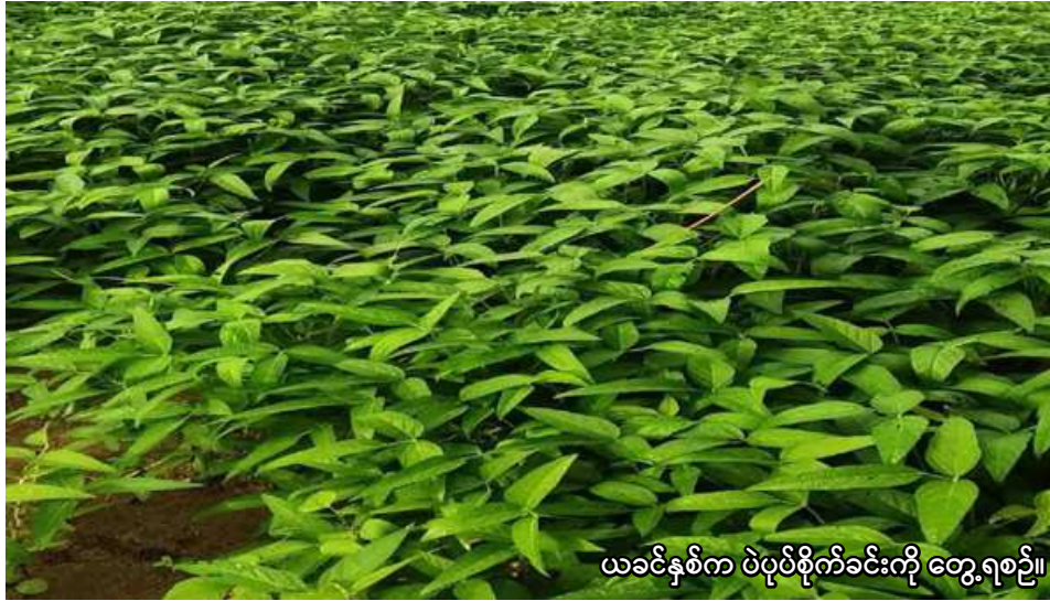
ယခင်နှစ်က ပဲပုပ်စိုက်ခင်းကို တွေ့ရစဉ်။

မုံရွာ မေ ၅ စစ်ကိုင်းတိုင်းဒေသကြီး နာဂကိုယ်ပိုင်အုပ်ချုပ်ခွင့်ရဒေသတွင် ယခုနှစ် မိုးသီးနှံ စိုက်ပျိုးရာသီ၌ ပဲပုပ် ၁၂၅၈ ဧက စိုက်ပျိုးမည်ဖြစ်ကြောင်း စစ်ကိုင်းတိုင်းဒေသကြီး စိုက်ပျိုးရေးဦးစီးဌာနမှ သိရသည်။ ယခုနှစ် မိုးသီးနှံစိုက်ပျိုးရာသီ၌ နာဂကိုယ်ပိုင်အုပ်ချုပ်ခွင့်ရဒေသတွင် ပဲပုပ်စိုက်ပျိုးရန် မြို့နယ်အလိုက် လျာထားမှုအနေဖြင့်