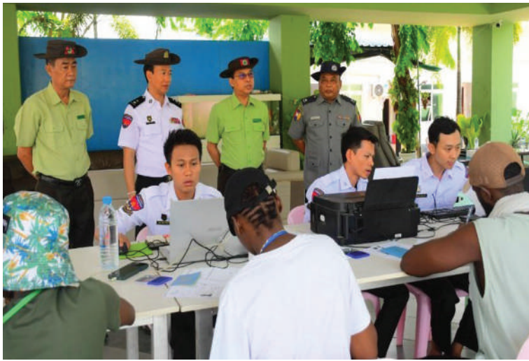
အွန်လိုင်းလိမ်လည်မှု(Telecom Fraud)နှင့် ဒုစရိုက်မူလုပ်ငန်းများတွင် ဆက်စပ်ပါဝင်ခဲ့ကြသည့် ပြည်ပနိုင်ငံသား သုံးဦးကို သက်ဆိုင်ရာနိုင်ငံများသို့ ထပ်မံလွှဲပြောင်းပေးအပ်စဉ်။