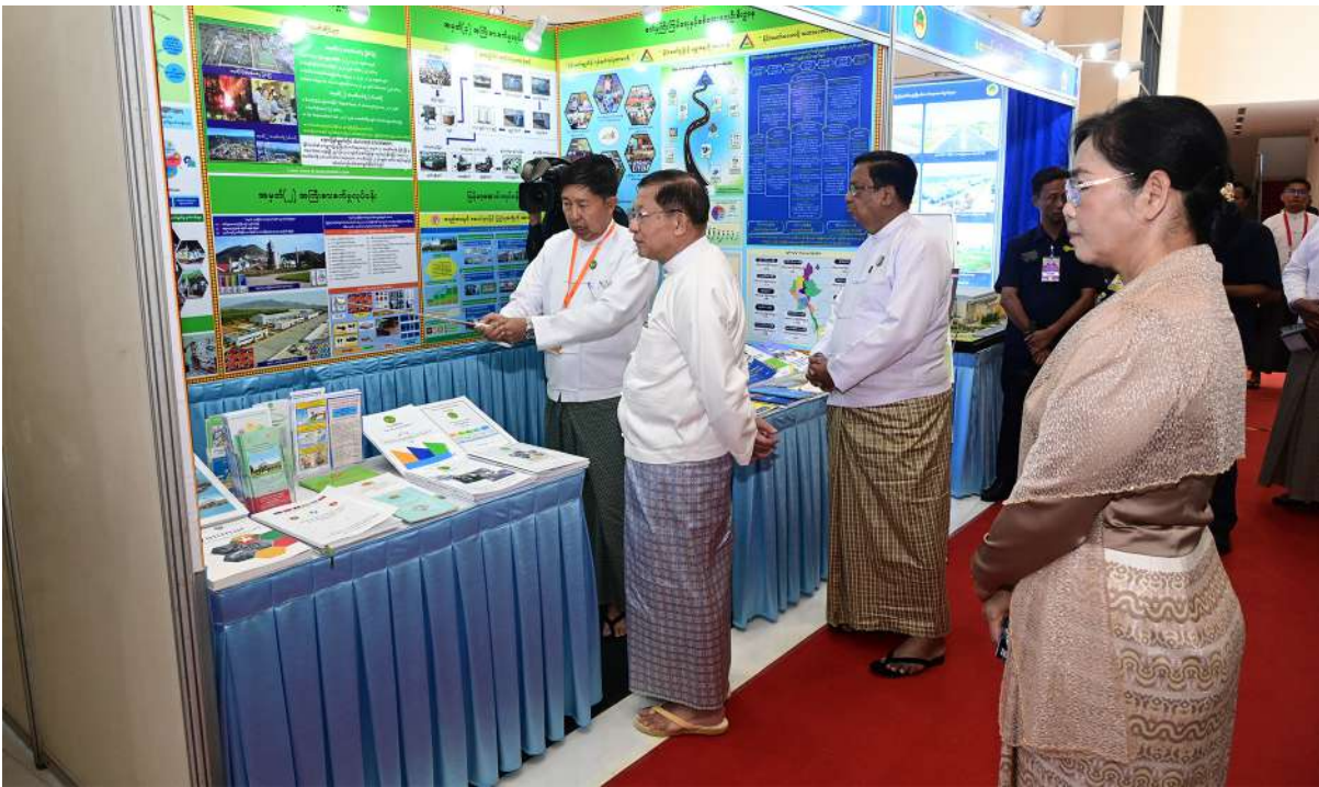
ပြည်ထောင်စုသမ္မတမြန်မာနိုင်ငံတော် နိုင်ငံတော်သမ္မတ ဦးမင်းအောင်လှိုင် ၂၀၂၅-၂၀၂၆ ပညာသင်နှစ် လူရည်ချွန်မောင်မယ်များ ဩဝါဒခံယူပွဲအခမ်းအနားတွင် ဝန်ကြီးဌာနများအလိုက် ပြသထားသည့်ပြခန်းများကို စိတ်ပါဝင်စားစွာ လှည့်လည်ကြည့်ရှုစဉ်။

ထို့နောက် နိုင်ငံတော်သမ္မတက ဩဝါဒအမှာစကားပြောကြားရာတွင် ဒီမိုကရေစီ နိုင်ငံတော်သစ်ကို စတင်လျှောက်လှမ်းသည့် အချိန်ကာလတွင် နိုင်ငံတော်က အားထားရသည့် လူရည်ချွန်မောင်မယ်များနှင့်တွေ့ဆုံပြီး အမှာစကားပြောကြားရသည့်အတွက် ဝမ်းသာဂုဏ်ယူမိကြောင်း၊ နိုင်ငံတော်သစ်တည်ဆောက်သည့်အခါတွင် မောင်တို့မယ်တို့ကဲ့သို့ လူတော်လူကောင်း၊ လူရည်ချွန်