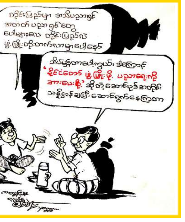
စဉ်းပြည်မှာ အသိပညာရှင် အတတ် ပညာ ရှင်တွေ ပေါများလာ စဉ်းပြည်က ဖွံ့ဖြိုးတိုးတက်လာမှာ ပေါ်နေတယ်။ သိပ်မှန်တာပေါ့ကွယ်။ ဒါကြောင့် 'နိုင်ငံတော် ဖွံ့ဖြိုးဖို့ ပညာရေးကို အားပေးဖို့' ဆိုတဲ့ ဆောင်ပုဒ် အစဉ်း သန့်ရှင်းစင်ကြယ်စေရေး အတွက် ကျောင်းကုန်းမြို့နယ်မှ ရန်ကုန်ဈေးကွက်သို့ ပြေလအတွင်း ငရုတ်သီးစိမ်းပိဿာချိန် ၄၇၀၀၀ ထိ တင်ပို့ရောင်းချနိုင်ခဲ့ကြောင်း ကျောင်းကုန်းမြို့နယ်မှ လယ်ယာထွက်ကုန် ရောင်းဝယ်ရေး ပွဲရုံလုပ်ငန်းရှင်

စိမ်း ၁၀ ပိဿာလျှင် ငွေကျပ် ၈၅၀၀၀ ထိ ပေါက်ဈေးရှိကြောင်း သိရသည်။ "ပြီးခဲ့တဲ့ ဧပြီလအတွင်း ကျောင်းကုန်းမြို့နယ်ကနေ ရန်ကုန်ဈေးကွက်ထဲကို ငရုတ်သီးစိမ်းပိဿာချိန် ၄၇၀၀၀ ထိ တင်ပို့ရောင်းချခဲ့ရပါတယ်။ ဒေသ လယ်ယာထွက်ကုန်တွေကို ဧရာဝတီတိုင်း အတွင်းထဲက အခြားနယ်မြေတွေအပြင် ရန်ကုန်ဈေးကွက်ကိုပဲ အဓိကတင်ပို့ ရောင်းချနေတာဖြစ်ပါတယ်။ ကျောင်းကုန်းမြို့နယ်ကထွက်တဲ့ ဒေသထွက် ငရုတ်သီးစိမ်းတွေက အရည်အသွေး ကောင်းပါတယ်" ဟု ကျောင်းကုန်း မြို့နယ်မှ လယ်ယာထွက်ကုန် ရောင်းဝယ်ရေး ပွဲရုံလုပ်ငန်းရှင်