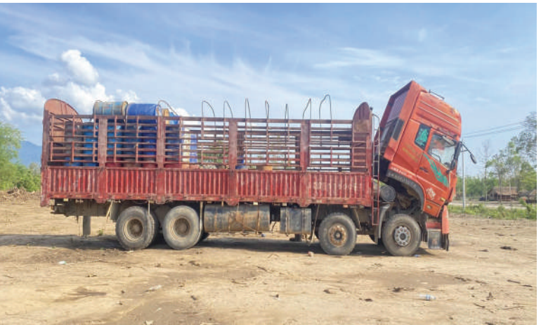
မော်လူးမြို့သို့ ချီတက်တိုက်ခိုက်သိမ်းပိုက်စဉ် လမ်းကြောင်းတစ်လျှောက် အကြမ်းဖက်သောင်းကျန်းသူများ တရားမဝင်လုပ်ကိုင်နေသော စက်သုံးဆီသိုလှောင်သည့် နေရာများမှ ပီပါခွဲများနှင့် တရားမဝင်စက်သုံးဆီများ သယ်ဆောင်သည့် မော်တော်ယာဉ်တို့ကို တွေ့ရစဉ်။