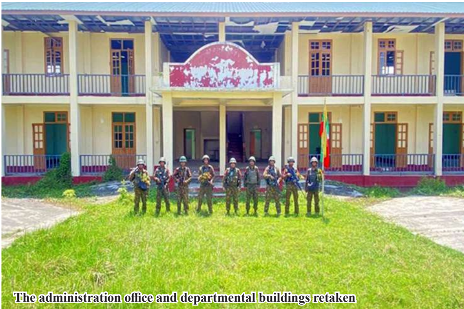
The administration office and departmental buildings retaken