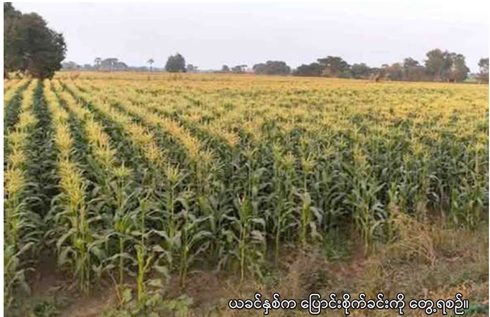
ယခင်နှစ်က ပြောင်းစိုက်ခင်းကို တွေ့ရစဉ်။

ရွှေဘို မေ ၅ စစ်ကိုင်းတိုင်းဒေသကြီး ရွှေဘိုခရိုင် ရွှေဘိုမြို့နယ်တွင် လာမည့် မိုးသီးနှံ စိုက်ပျိုးရာသီ၌ အစေ့ထုတ်ပြောင်းနှင့်ဖူးစားပြောင်း စုစုပေါင်း ၂၈၄၁ ဧက စိုက်ပျိုးမည် ဖြစ်ကြောင်း ရွှေဘိုမြို့နယ် စိုက်ပျိုးရေး ဦးစီးဌာနမှ သိရသည်။ ရွှေဘိုမြို့နယ်တွင် မိုးသီးနှံ စိုက်ပျိုးရာသီ အစေ့ထုတ်ပြောင်းနဲ့