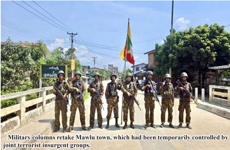
Military columns retake Mawlu town, which had been temporarily controlled by joint terrorist insurgent groups.