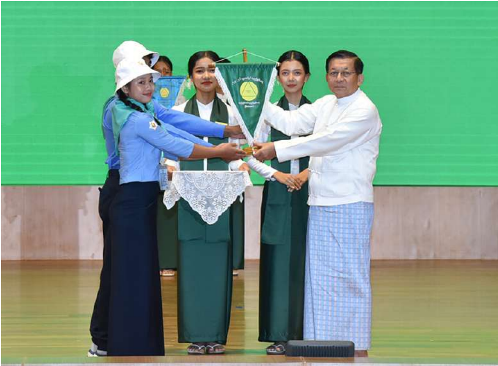
ပြည်ထောင်စုသမ္မတ မြန်မာနိုင်ငံတော် နိုင်ငံတော်သမ္မတ ဦးမင်းအောင်လှိုင် ၂၀၂၆ ခုနှစ် လူရည်ချွန် စခန်းအလိုက် အထိမ်းအမှတ် အလံများကို လူရည်ချွန် မောင်မယ်များထံ ပေးအပ်စဉ်။

ပြုနေပြီကို မောင်တို့မယ်တို့ အသိပင်ဖြစ်ကြောင်း၊ မိမိတို့အစိုးရအဖွဲ့အသီးသီးတို့၌ လူရည်ချွန်ရွေးချယ်ခံခဲ့ရသူ ၁၂ ဦး ပါဝင်ကြောင်းကိုလည်း ဝမ်းမြောက်ဂုဏ်ယူနိုင်ရေး အသိပေးပြောကြားလိုကြောင်း။