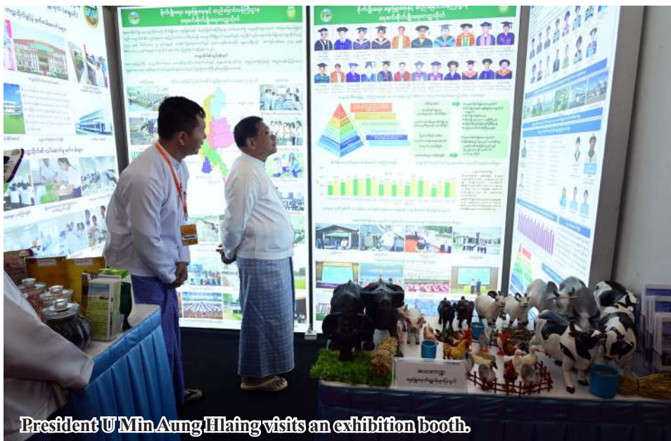
President U Min Aung Hlaing visits an exhibition booth.

are capable of contributing to the nation's interests through practical educational development. He explained that the project encourages students to emulate those selected as outstanding, fostering a desire to strive for excellence, healthy competition, and a spirit of comprehensive learning. He added that this noble initiative has evolved over decades into a prestigious educational tradition for producing valuable human resources. He noted that former outstanding students are now serving in high-ranking state positions or