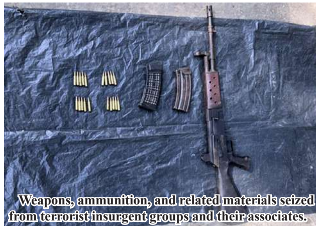
Weapons, ammunition, and related materials seized from terrorist insurgent groups and their associates.

tory flowers and garlands along the entire route. Military columns are currently conducting necessary area control operations in these regions and are accelerating security and control efforts to quickly reopen the Mawlu-Nant Si Aung road section. 100