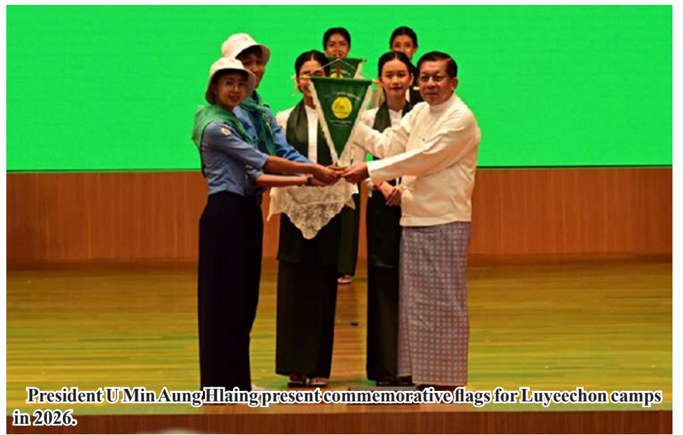
President U Min Aung Hlaing present commemorative flags for Luyeechon camps in 2026.

Then, he stated that the Outstanding Students Project aims to nurture healthy, morally upright, and brilliant young intellectuals who possess the "Five Strengths" and