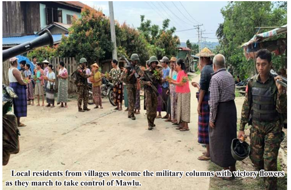
Local residents from villages welcome the military columns with victory flowers as they march to take control of Mawlu.

Nay Pyi Taw May 5 The military, in cooperation with local residents, has been conducting counter-terrorism operations in areas temporarily controlled by terrorist insurgents who are committing acts of violence, in order to restore national stability, peace, and development. As a result, it has been gradually regaining control. On April 30, it fully recaptured and secured Indaw town in Katha District, which had been temporarily held by terrorists. Today, it has further retaken control of Mawlu town in Indaw Township, which was also temporarily under the control of terrorist insurgents. Mawlu town is located