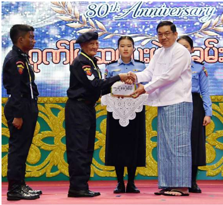
Vice-President U Nyo Saw presents an honorary cash award.

Nay Pyi Taw May 5 Vice-President of the Republic of the Union of Myanmar U Nyo Saw attended and delivered a speech at the ceremony to mark the 80 th Anniversary of Myanmar Fire Brigade Day held at the Myanmar International Convention Centre I (MICC I) in Nay Pyi Taw this morning.