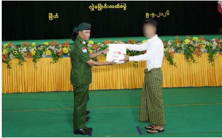
ကမ်းရိုးတန်းဒေသတိုင်းစစ်ဌာနချုပ် တိုင်းမှူး ဗိုလ်ချုပ်ကျော်ကျော်ဟန် ထံ PDF အမည်ခံ အဖွဲ့ဝင်တစ်ဦးကို ဆုကြေးငွေနှင့် ထောက်ပံ့ပစ္စည်းပေးအပ်စဉ်။

နေပြည်တော် မေ ၅ နိုင်ငံတော်အစိုးရသည် PDF အပါအဝင် အဖွဲ့အစည်းအမျိုးမျိုးအမည်ခံ၍ လက်နက်ကိုင် ဆန့်ကျင်လျက်ရှိသည့် အဖွဲ့အစည်းများအတွင်း ရောက်ရှိနေသူများကို ဥပဒေဘောင်အတွင်းသို့ ပြန်လည်ဝင်ရောက်ရန်ဖိတ်ခေါ်၍ ပြန်လည်ဝင်ရောက်လာကြသူများကိုလည်း လိုအပ်သည့် ကူညီပံ့ပိုးမှုများ ဆောင်ရွက်ပေးလျက်ရှိရာ နိုင်ငံတော်နှင့် တပ်မတော်၏ ငြိမ်းချမ်းရေးလုပ်ငန်းစဉ်များကို နားလည်သဘောပေါက်လာသည့် PDF အမည်ခံအဖွဲ့မှ အဖွဲ့ဝင် အမျိုးသား ငါးဦး၊ အမျိုးသမီး တစ်ဦး စုစုပေါင်း ခြောက်ဦးတို့သည် လက်နက်ခဲယမ်းများနှင့်အတူ ဥပဒေဘောင်အတွင်းသို့ ထပ်မံဝင်ရောက်လာကြသည်။