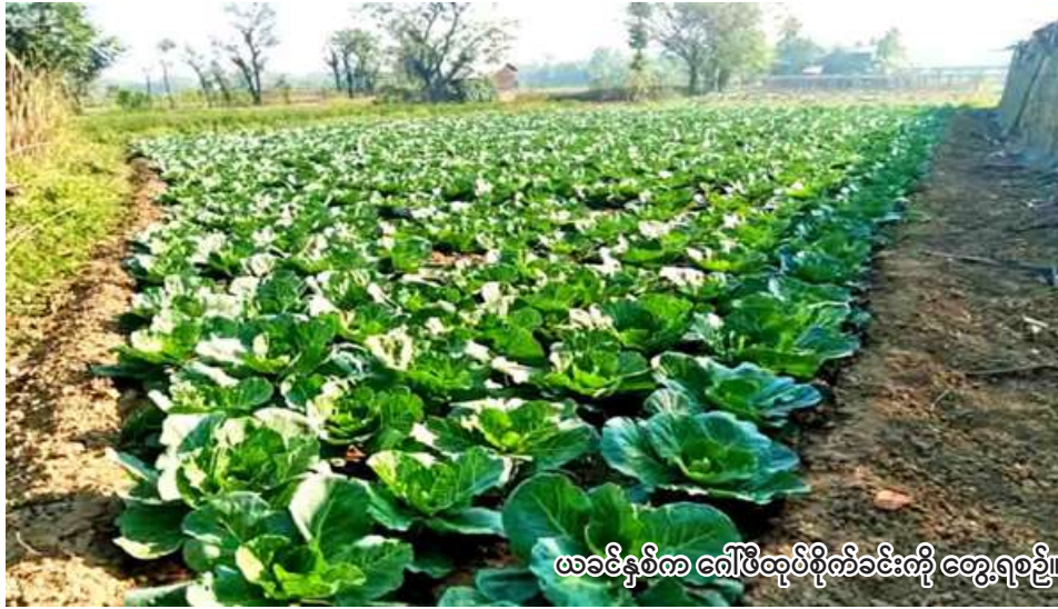
ယခုနှစ်ကလေးမြို့နယ်တွင် စိုက်ပျိုးထားသော ဟင်းသီးဟင်းရွက်

ကလေး မေ ၅ စစ်ကိုင်းတိုင်းဒေသကြီး ကလေးခရိုင် ကလေးမြို့နယ်တွင် ယခုနှစ် မိုးသီးနှံစိုက်ပျိုးရာသီ၌ ဟင်းသီးဟင်းရွက် ၈၀၁၄ ဧက စိုက်ပျိုးမည် ဖြစ်ကြောင်း ကလေးမြို့နယ် စိုက်ပျိုးရေးဦးစီးဌာနမှ သိရသည်။ မိုးသီးနှံစိုက်ပျိုးရာသီ၌ ကလေးမြို့နယ်တွင် ဟင်းသီးဟင်းရွက် ၈၀၁၄ ဧက စိုက်ပျိုးရန်အတွက်