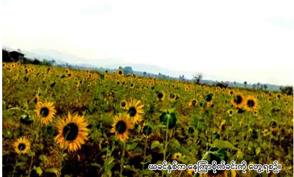
ဖခင်နှစ်က နေကြာစိုက်ခင်းကို တွေ့ရစဉ်။

ရေဦး မေ ၅ စစ်ကိုင်းတိုင်းဒေသကြီး ရေဦးခရိုင် ဒီပဲယင်းမြို့နယ်တွင် ဆောင်းသီးနှံ စိုက်ပျိုးရာသီ၌ နေကြာ ၅၁၆၉ ဧက စိုက်ပျိုးမည် ဖြစ်ကြောင်း ရေဦးခရိုင် စိုက်ပျိုးရေးဦးစီးဌာနမှ သိရသည်။ မိုးသီးနှံစိုက်ပျိုးရာသီ၌ ဒီပဲယင်းမြို့နယ်တွင် နေကြာ