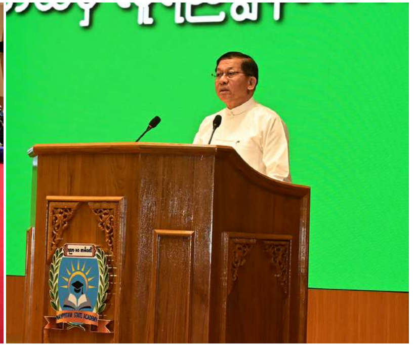
ပြည်ထောင်စုသမ္မတမြန်မာနိုင်ငံတော် နိုင်ငံတော်သမ္မတ ဦးမင်းအောင်လှိုင် ၂၀၂၅-၂၀၂၆ ပညာသင်နှစ် လူရည်ချွန်မောင်မယ်များကို တွေ့ဆုံပြောပြအမှာစကားပြောကြားစဉ်။