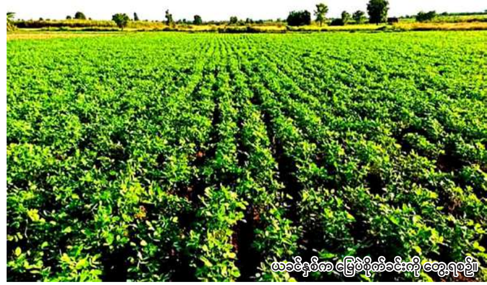
ယခုနှစ်က မြေပဲစိုက်ပျိုးရေးကို တွေ့ရစဉ်။