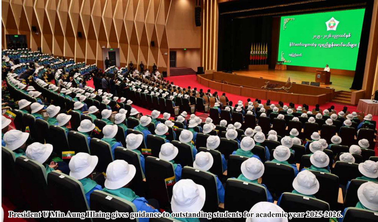
President U Min Aung Hlaing gives guidance to outstanding students for academic year 2025-2026.

Although not every youth will be able to lead a country, all youths are human resources that will shape the future nation