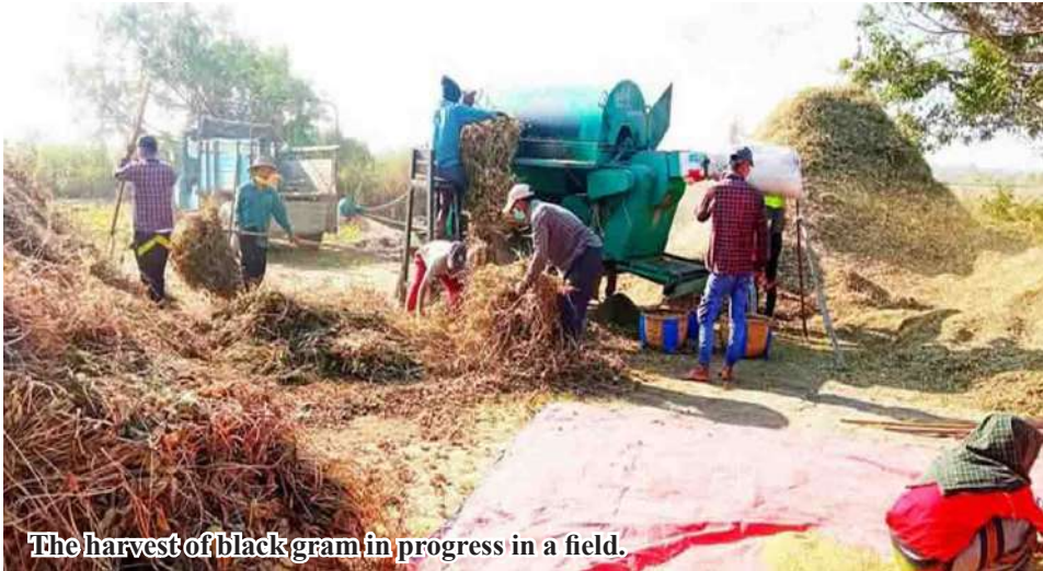
The harvest of black gram in progress in a field.