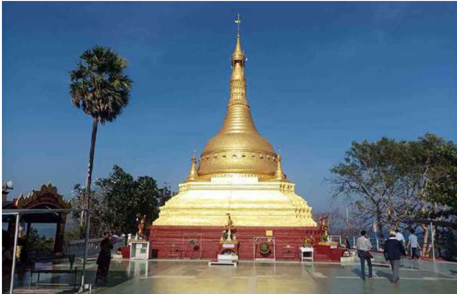
ဟိုင်းကြီးကျွန်းမြို့ပေါ်က ကျိုက်ပိစေတီတော်ကို ဖူးတွေ့ရစဉ်။

ရုံးရုံးရှိနေကြတယ်။ တြိဂံပုံသုံးဘက်ချွန်တည်ရှိနေတဲ့ ဟိုင်းကြီးကျွန်းမြို့မှာ ကုန်းလမ်းဝင်ပေါက်ထွက်ပေါက်တစ်ခုနဲ့ ရေလမ်းဝင်ပေါက်ထွက်ပေါက်တစ်ခု စုစုပေါင်း နှစ်ခုသာရှိနေပါတယ်။ ဒေသခံတွေ၊ ခရီးသွားဧည့်သည်တွေအများစုက ရေကြောင်းလမ်းဖြစ်တဲ့ လှေသင်္ဘောတွေကိုသာ အသုံးပြုသွားလာနေကြတယ်။ ဒါ့ပြင် ဟိုင်းကြီးကျွန်းနဲ့ တခြားမြို့ရွာဒေသတွေကို ပြေးဆွဲနေတဲ့ ခရီးသည်တင်ကားတွေ၊ မော်တော်ယာဉ်အသင်းတွေ မရှိကြဘဲ လှေ၊ သင်္ဘောတွေ၊ ရေယာဉ်အသင်းတွေသာ ရှိနေကြတယ်။