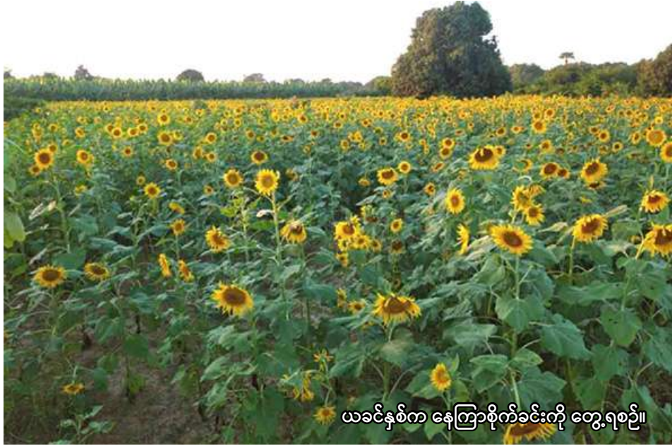
ယင်းမာပင်ခရိုင်တွင် နေကြာစိုက်ခင်းကို တွေ့ရစဉ်။

ယင်းမာပင် မေ ၁ စစ်ကိုင်းတိုင်းဒေသကြီး ယင်းမာပင်ခရိုင်တွင် ယခုနှစ်မိုးသီးနှံ စိုက်ပျိုးရာသီ၌ နေကြာကေ ၁၆၂၅၀ စိုက်ပျိုးမည်ဖြစ်ကြောင်း ယင်းမာပင်ခရိုင် စိုက်ပျိုးရေးဦးစီးဌာနမှ သိရသည်။