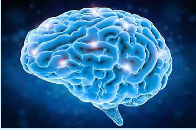
လမ်းလျှောက်ခြင်းဟာ မိမိ တို့ရဲ့ ဦးနှောက်တွေအတွက်

အကျိုးကျေးဇူးများစွာ ပေးစွမ်း ရှိတဲ့ စိတ်ဖိစီးမှုတွေ လျော့ကျ တယ်လို့ သုတေသနတစ်ခုမှာ လေ့လာတွေ့ရှိရပါတယ်။ ဖော်ပြထားပါတယ်။ ဒါ့အပြင် အဲဒီဟော်မုန်းက လမ်းလျှောက်တဲ့ အခါမှာ ဦးနှောက်ရဲ့ အလုံးစုံကျန်းမာရေး အန်ဒေါဖင်လိုခေါ်တဲ့ ဟော်မုန်းတစ်မျိုး ထွက်ရှိမှု မြင့်တက် လာပါတယ်။ အဲဒီဟော်မုန်းက မှတ်ဉာဏ်ချို့ယွင်းရှားသွပ်ခြင်း နာကျင်မှုဝေဒနာကို သက်သာ ရောဂါနဲ့ အယ်ဒိုင်းမားရောဂါ စေတဲ့ဟော်မုန်းပါ။ အန်ဒေါဖင် တို့ ဖြစ်ပွားနိုင်ခြေကိုတောင်မှ လျော့ချပေးနိုင်ပါတယ်။