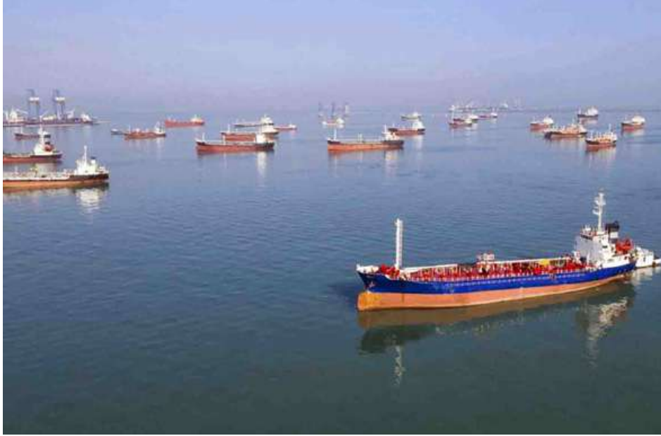
ယခင်က လောင်စာဆီနှင့်ကုန်တင်သင်္ဘောများ ဟော်မုစ်ရေလက်ကြားမှ ဖြတ်သန်းနေစဉ်။

ဆုံးလောင်စာဆီသယ်ယူပို့ဆောင်ရေးလမ်းကြောင်းများထဲမှတစ်ခုဖြစ်သည်။ တစ်နေ့လျှင် ရေနံစည်ပေါင်း သန်း ၂၀ ခန့်သည် ပါရဂူပင်လယ်ကွေ့နှင့် အာရေဗျပင်လယ်ကြားရှိ ဤကျဉ်းမြောင်းသောလမ်းကြောင်းကို ပုံမှန်ဖြတ်သန်းသွားလာလေ့ရှိသည်။ ထို့ကြောင့် ဤပိတ်ဆို့ထားသောနေရာရှိ အနှောင့်အယှက်များသည် ကမ္ဘာ့ဈေးကွက်များအပေါ်ကြီးမားသော ဩဇာလွှမ်းမိုးမှုကို ဖြစ်ပေါ်စေနိုင်သည်။