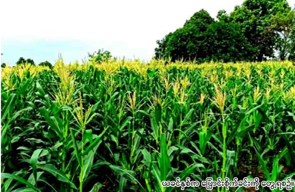
ယခုနှစ်တွင် မြောင်းမြို့နယ်ခွဲတွင်

ကျောက်မြောင်း မေ ၁ ရက်က စိုက်ပျိုးရေးနှင့် ဖွံ့ဖြိုးရေး ကော်မရှင် ဦးစီးဌာနမှ သိရသည်။ ကျောက်မြောင်း မေ ၁ ရက်က စိုက်ပျိုးရေးနှင့် ဖွံ့ဖြိုးရေး ကော်မရှင် ဦးစီးဌာနမှ သိရသည်။ ယခုနှစ် မိုးသီးနှံစိုက်ပျိုးရာသီ ၌ ကျောက်မြောင်းမြို့နယ်ခွဲတွင် အစေ့ထုတ်ပြောင်း ၃၅၇၉ ဧကနှင့် ဖူးစားပြောင်း ၃၆၅၃ ဧက စုစုပေါင်း ၇၂၃၂ ဧက စိုက်ပျိုးမည်ဖြစ်ကြောင်း ကျောက်မြောင်းမြို့နယ်ခွဲ ကြောင်း ကျောက်မြောင်းမြို့နယ်ခွဲ စိုက်ပျိုးရေးဦးစီးဌာနမှ သိရသည်။ ယခုနှစ် မိုးသီးနှံစိုက်ပျိုးရာသီ ၌ ကျောက်မြောင်းမြို့နယ်ခွဲတွင် အစေ့ထုတ်ပြောင်း ၃၅၇၉ ဧကနှင့် ဖူးစားပြောင်း ၃၆၅၃ ဧက စုစုပေါင်း ၇၂၃၂ ဧက စိုက်ပျိုးမည်ဖြစ်ကြောင်း ကျောက်မြောင်းမြို့နယ်ခွဲ ကြောင်း ကျောက်မြောင်းမြို့နယ်ခွဲ စိုက်ပျိုးရေးဦးစီးဌာနမှ သိရသည်။