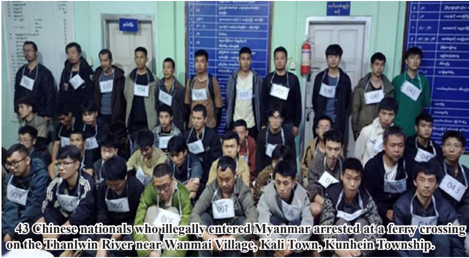
43 Chinese nationals who illegally entered Myanmar arrested at a ferry crossing on the Thanlwin River near Wanmai Village, Kali Town, Kunhein Township.

Nay Pyi Taw May 1 The Myanmar government has been annihilating the online scam and gambling, which constitute a severe, multifaceted menace to the world, in all seriousness, as a national task, and cooperating and coordinating with governments of the neighboring countries, alongside the internal forces in energeti-