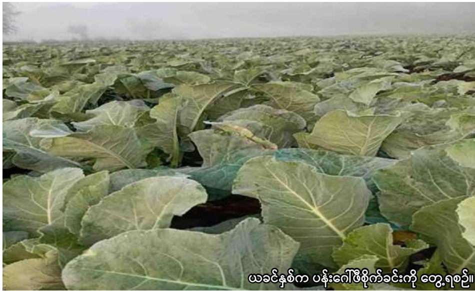
ယခင်နှစ်က ပန်းဂေါ်ဖီစိုက်ခင်းကို တွေ့ရစဉ်။