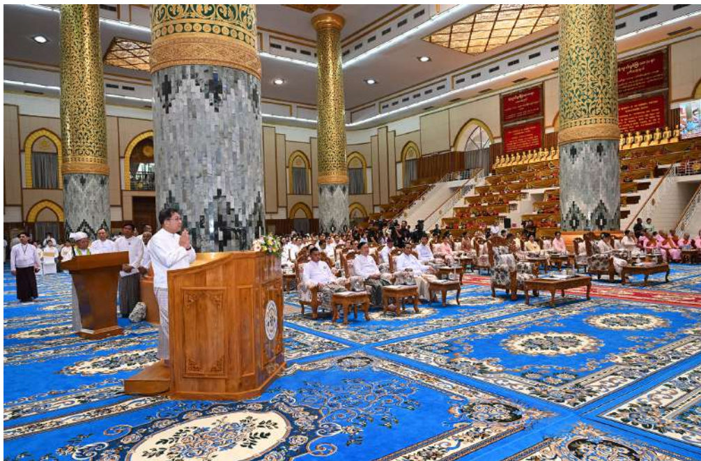
ဆရာတော်ကြီးများထံ ပြည်ထောင်စုသမ္မတမြန်မာနိုင်ငံတော် နိုင်ငံတော်သမ္မတ ဦးမင်းအောင်လှိုင် သာသနာရေး ဆိုင်ရာများ လျှောက်ထားတင်ပြစဉ်။

ဆရာတော်ကြီးက သာရဏီယကထာကို မြှောက်ကြားတော်မူပြီး သီတဂူဆရာတော်ကြီး က သမ္မောဒနိယကထာကို မြှောက်ကြားချီးမြှင့် တော်မူသည်။ ထို့နောက် ဆဋ္ဌသင်္ဂါယနာတင် မဟာ ထေရ်မြတ်တို့ကိုပူဇော်သောအားဖြင့် တိပိဋက ရေဓမ္မဘဏ္ဍာဂါရိက ဆရာတော်ဘဒ္ဒန္တဝါယာ မိန္ဒာဘိဝံသနှင့် တိပိဋကရေဓမ္မဘဏ္ဍာဂါရိက ဆရာတော် ဘဒ္ဒန္တပညာဝံသာဘိဝံသတို့က ဝိနယပိဋကတ်တော်ကို သင်္ဂါယနာ အမေး၊ အဖြေပြုလုပ်ပြီး သံဃာတော်အရှင်သူမြတ် တို့က စုပေါင်းသံပြိုင်ရွတ်ဆိုပူဇော်ကြသည်။ ၎င်းနောက် နိုင်ငံတော်သမ္မတ ဦးမင်းအောင်လှိုင်က သာသနာရေးဆိုင်ရာ များနှင့်ပတ်သက်၍ လျှောက်ထားတင်ပြရာ တွင် သာသနာ့သမိုင်းဝင် ဆဋ္ဌသင်္ဂါယနာ မဟာ ဓမ္မသဘင်ကြီးအောင်မြင်ပြီးမြောက်