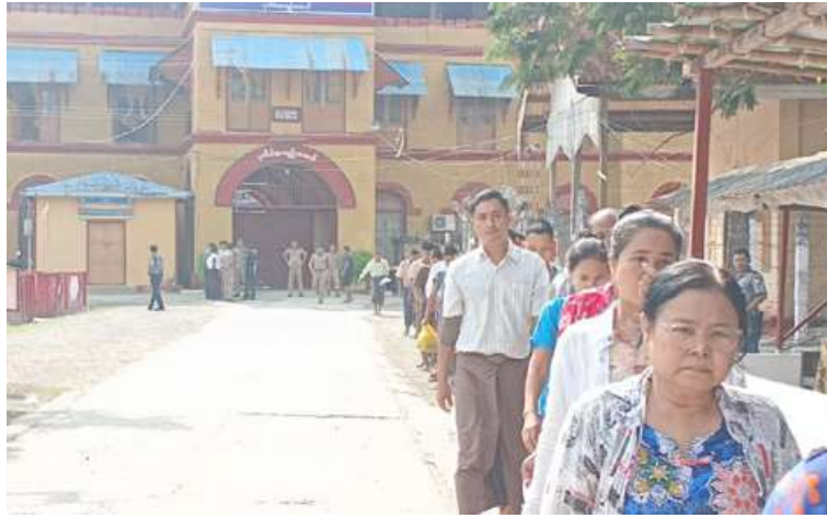
ပုသိမ်အကျဉ်းထောင်မှ အကျဉ်းသား၊ အကျဉ်းသူများ ပြစ်ဒဏ်လွတ်ငြိမ်းခွင့်ဖြင့် ပြန်လည်လွတ်မြောက်လာမှုကို တွေ့ရစဉ်။