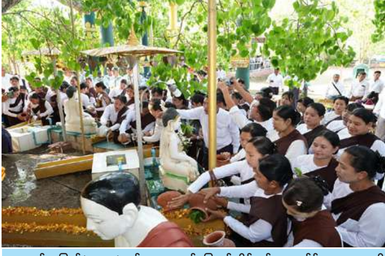
ကဆုန်လပြည့်(ဗုဒ္ဓနေ့)တွင် အနောက်မြောက်တိုင်းစစ်ဌာနချုပ်၌ မဟာဗောဓိညောင်ပင်အား ညောင်ရေသွန်းလောင်းပူဇော်ကြစဉ်။