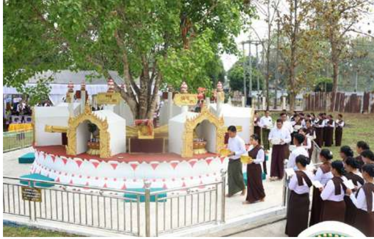
ကဆုန်လပြည့်(ဗုဒ္ဓနေ့)၌ မြောက်ပိုင်းတိုင်းစစ်ဌာနချုပ် တိုင်းမှူး ဗိုလ်ချုပ်အောင်ဇော်ထွေး တက်ရောက်လာကြသူများက ညောင်ရေသွန်းလောင်းပူဇော်ပွဲကျင်းပစဉ်။