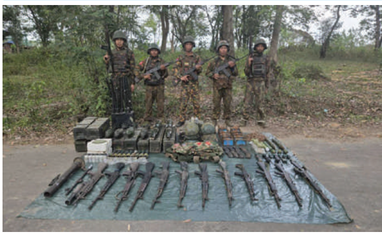
အကြမ်းဖက်သောင်းကျန်းသူပူးပေါင်းအဖွဲ့များထံမှ သိမ်းပိုက်ရရှိသည့် လက်နက်၊ ခဲယမ်းနှင့် ဆက်စပ်ပစ္စည်းများကို တွေ့ရစဉ်။