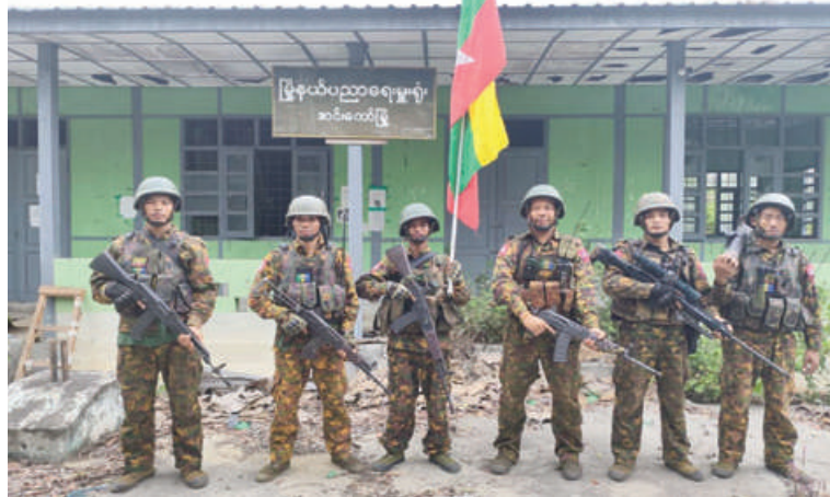
တပ်မတော်စစ်ကြောင်းများက အကြမ်းဖက်သောင်းကျန်းသူပူးပေါင်းအဖွဲ့များ ယာယီစိုးမိုးထားသည့် အင်းတော်မြို့ မြို့နယ်ပညာရေးမှူးရုံး ပြန်လည်သိမ်းပိုက် ရရှိခဲ့မှု မှတ်တမ်းဓာတ်ပုံ။

PDF အမည်ခံ အကြမ်းဖက် သောင်းကျန်းသူများအနေဖြင့် NUG၊ CRPH တို့၏ သွေးထိုးမြှောက်ပင့်မှုများကို နားယောင်ပြီး ယခုကဲ့သို့ အကြမ်းဖက် လုပ်ငန်းများ လုပ်ဆောင်ခြင်းများသည် အဆိုပါဒေသအတွင်း နေထိုင်လျက်ရှိသော ဒေသခံပြည်သူလူထု၏ လူမှုစီးပွားဘဝ ဖွံ့ဖြိုးတိုးတက်မှုများတွင် များစွာ နောက်ကျစေသဖြင့် နိုင်ငံတော်နှင့် ဒေသ အတွက် အမှန်တကယ်အကျိုးပြုလိုပါက နီးစပ်ရာလုံခြုံရေးစခန်းများနှင့် ချိတ် ဆက်၍ အလင်းဝင်ရောက်သင့်ကြောင်း သတင်းရရှိပါသည်။ (၅၀၁)