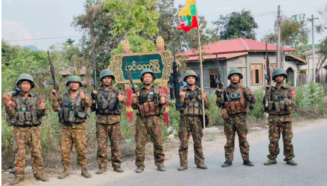
တပ်မတော်စစ်ကြောင်းများက အကြမ်းဖက်သောင်းကျန်းသူ ပူးပေါင်းအဖွဲ့များ ယာယီစိုးမိုးထားသည့် အင်းတော်မြို့ကို ပြန်လည်သိမ်းပိုက်ရရှိခဲ့မှုမှတ်တမ်းဓာတ်ပုံ။

နေပြည်တော် ဧပြီ ၃၀ တပ်မတော်စစ်ကြောင်းများက အကြမ်းဖက်သောင်းကျန်းသူပူးပေါင်းအဖွဲ့များ ယာယီစိုးမိုးထားသော အင်းတော်မြို့နှင့် အဆိုပါဒေသတစ်ဝိုက်ကို ယနေ့တွင် အလုံးစုံပြန်လည်သိမ်းပိုက်ထိန်းချုပ်နိုင်ခဲ့သည်။ NUG လက်ဝေခံ PDF အမည်ခံ အကြမ်းဖက်သောင်းကျန်းသူ ပူးပေါင်းအဖွဲ့များသည် မန္တလေးတိုင်းဒေသကြီးနှင့် စစ်ကိုင်းတိုင်းဒေသကြီးအတွင်းရှိ မြို့ရွာများ၌ အုပ်ချုပ်မှုယန္တရားများ ရပ်တန့်စေရန်အတွက် ဌာနဆိုင်ရာအဆောက်အအုံများ၊ ဆေးရုံ၊ ဆေးခန်းများ၊ စက်ရုံ၊ အလုပ်ရုံများကို မိုင်းထောင်ဖောက်ခွဲခြင်း၊ ဒေသခံပြည်သူများ၏ နေအိမ်များကို မီးရှို့ဖျက်ဆီးခြင်း၊ ဘာသာရေးဆိုင်ရာ အဆောက်အအုံများတွင် စာမျက်နှာ ၂၈ ကော်လံ ၁ ❖