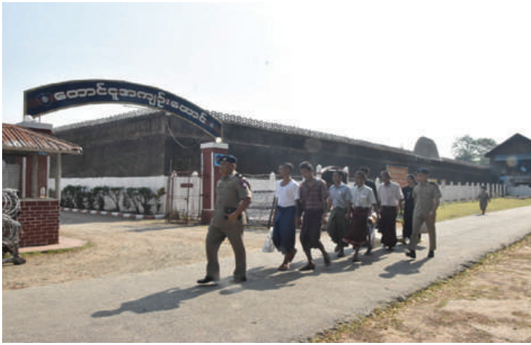
တောင်ငူအကျဉ်းထောင်မှ အကျဉ်းသား၊ အကျဉ်းသူများ ပြစ်ဒဏ်လွတ်ငြိမ်းခွင့်ဖြင့် ပြန်လည်လွတ်မြောက်လာမှုကို တွေ့ရစဉ်။