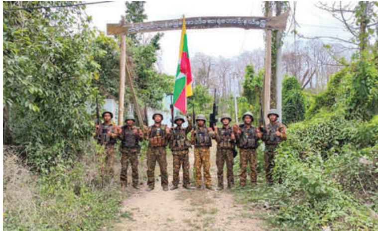
တပ်မတော် စစ်ကြောင်းများက အကြမ်းဖက်သောင်းကျန်းသူပူးပေါင်းအဖွဲ့များ ယာယီစိုးမိုးထားသည့် အင်းတော်မြို့ သမိုင်းဝင်ဂျပုန်မြေအောက်ဆေးရုံဟောင်း နယ်မြေ ပြန်လည်သိမ်းပိုက်ရရှိခဲ့မှု မှတ်တမ်းဓာတ်ပုံ။