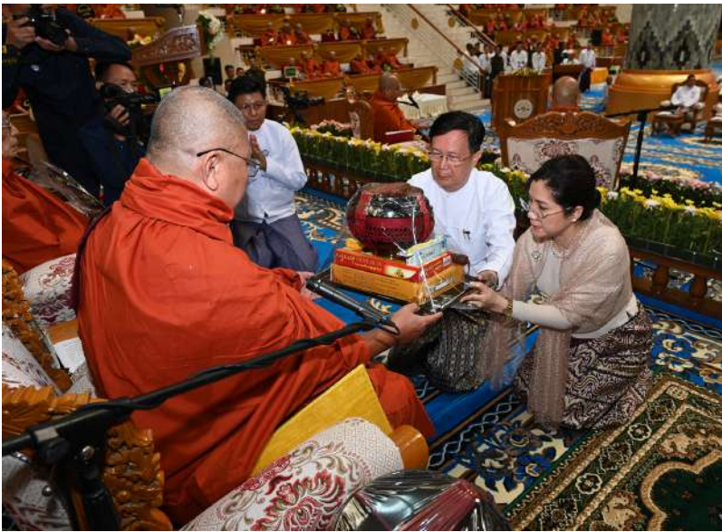
မစိုးရိမ်တိုက်သစ်ဆရာတော်ကြီးထံ အမျိုးသားလွှတ်တော် ဥက္ကဋ္ဌ ဦးအောင်လင်းဒွေး နှင့်ဇနီးတို့က လှူဖွယ်ပစ္စည်းများ ဆက်ကပ်လှူဒါန်းစဉ်။

ထိုသို့ ဆဋ္ဌသင်္ဂါယနာတင်မဟာဓမ္မ သဘင်ကြီး ခြိမ်းခြိမ်းသံကျင်းပခဲ့သော မဟာပါသာဏ လိုဏ်ဂူသိမ်တော်ကြီး၊ ဥက္ကရကုရစသော ကျောင်းဆောင်ကြီး လေးဆောင်၊ မဟာသိမ်တော်ကြီး၊ သုံးထပ် ဆွမ်းစားကျောင်းဆောင်၊ ပိဋကတ်ပုံနှိပ် တိုက်၊ ပိဋကတ်ပြတိုက်၊ မဟာနာယက