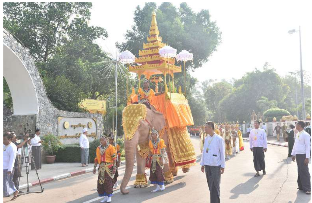
ပိဋကသုံးပုံကို မင်္ဂလာဆင်ဖြူတော်ရတနာဖြင့် ပင့်ဆောင်၍ မဟာပါသာဏလိုဏ်ဂူသိမ်တော်ကြီးအား လက်ယာရစ် လှည့်လည်ပူဇော်ကြည်ညိုကြစဉ်။

ကြပြီး နိုင်ငံတော်သမ္မတနှင့် ဇနီးတို့နှင့်အတူ ပြည်သူ့လွှတ်တော်ဥက္ကဋ္ဌ ဦးခင်ရီနှင့် ဇနီး၊ အမျိုးသားလွှတ်တော်ဥက္ကဋ္ဌဦးအောင်လင်းဒွေး နှင့်ဇနီး၊ တပ်မတော်ကာကွယ်ရေးဦးစီးချုပ် ဗိုလ်ချုပ်ကြီးရဲဝင်းဦးနှင့်ဇနီး၊ ပြည်ထောင်စု ဝန်ကြီးများနှင့် ဇနီးများ၊ ရန်ကုန်တိုင်းဒေသ ကြီး ဝန်ကြီးချုပ်နှင့်ဇနီး၊ ကာကွယ်ရေးဦးစီး ချုပ်ရုံးမှ အဆင့်မြင့်တပ်မတော်အရာရှိကြီး များနှင့်ဇနီးများ၊ မြန်မာနိုင်ငံဆိုင်ရာ နိုင်ငံ တကာသံရုံးများမှ သံအမတ်ကြီးများ၊ စစ်သံမှူးများနှင့် တာဝန်ရှိသူများ၊ ဒုတိယ ဝန်ကြီးများ၊ ဖိတ်ကြားထားသည့် ဧည့်သည် တော်ကြီးများနှင့်တာဝန်ရှိသူများတက်ရောက်