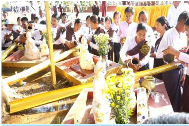
ကဆုန်လပြည့်(ဗုဒ္ဓနေ့)တွင် အရှေ့အလယ်ပိုင်းတိုင်းစစ်ဌာနချုပ်၌ ကဆုန်ညောင်ရေသွန်းလောင်းပူဇော်ပွဲကျင်းပစဉ်။