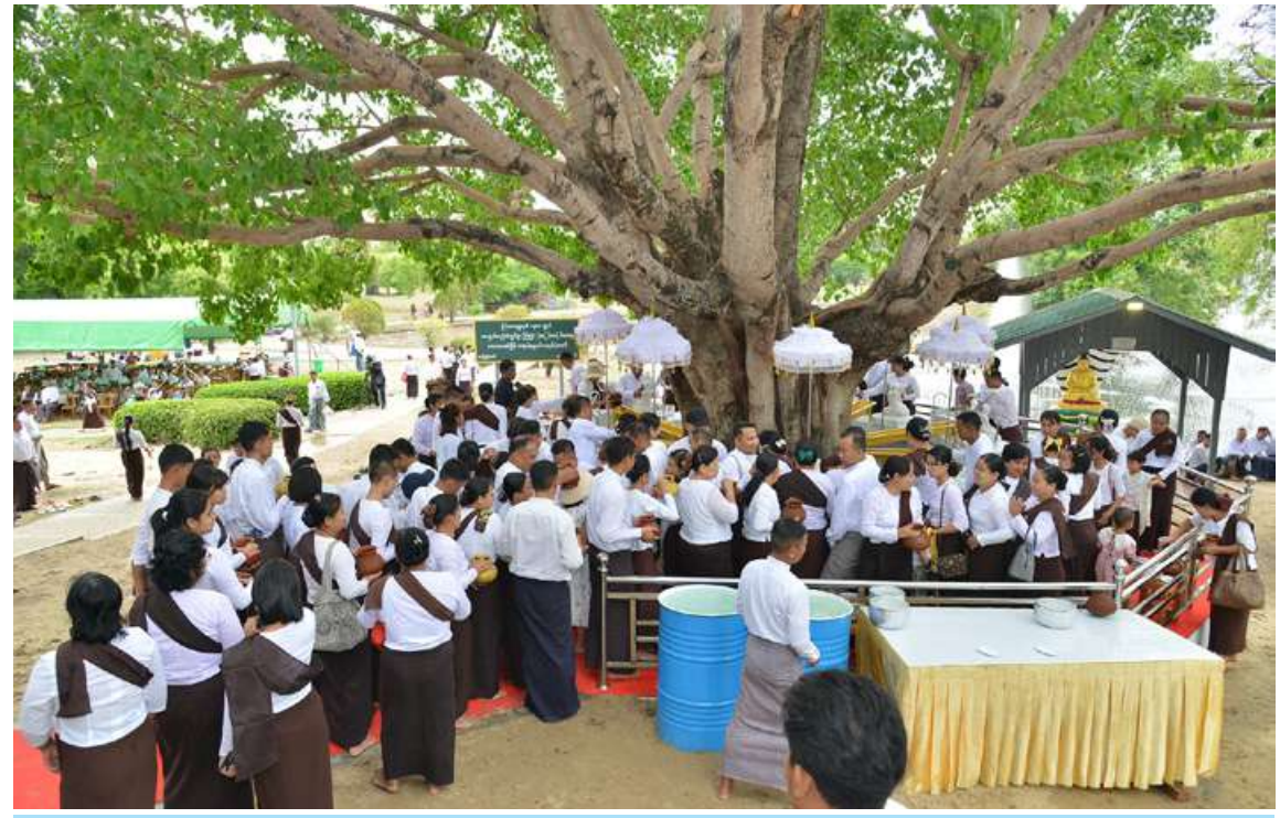
ကာကွယ်ရေးဦးစီးချုပ်ရုံး(ကြည်း၊ ရေ၊ လေ) မိသားစုများ၏ ကောဇာသမအကြိမ် ကဆုန်ညောင်ရေသွန်းပွဲတော်ကို ဧယျာသီရိမြို့နယ် လောကချမ်းသာဆုတောင်းပြည့်အသင်း ဘုရားကြီးရှိ မဟာဗောဓိညောင်ပင်များ ကဆုန်ညောင်ရေသွန်းလောင်းပူဇော်ခြင်းမင်္ဂလာအခမ်းအနား ကျင်းပပြုလုပ်စဉ်။

ကာကွယ်ရေးဦးစီးချုပ်ရုံးမှ အဆင့်မြင့်တပ်မတော်အရာရှိကြီးများနှင့် ဇနီးများ၊ နေပြည်တော်တိုင်းစစ်ဌာနချုပ် တိုင်းမှူးနှင့်ဇနီး၊ အရာရှိ၊ အရာခံ၊ အကြပ်၊ စစ်သည်များနှင့် မိသားစုဝင်များ တက်ရောက်ကြသည်။ ဦးစွာ ဒုတိယတပ်မတော်ကာကွယ်ရေးဦးစီးချုပ် ကာကွယ်ရေးဦးစီးချုပ်(ကြည်း) ဗိုလ်ချုပ်ကြီးကျော်စွာလင်းနှင့် ဇနီးဒေါ်နန်းကူးကူတို့က လောကချမ်းသာဆုတောင်းပြည့်အသင်း ဘုရားကြီးအား ဆီမီး၊ ပန်း၊ ရေချမ်း ကပ်လှူပူဇော်သည်။ ထို့နောက် ကဆုန်ညောင်ရေသွန်းလောင်းပူဇော်ခြင်းမင်္ဂလာအခမ်းအနားကို ကျင်းပရာ “နမော တဿ” သုံးကြိမ်ရွတ်ဆို ဘုရားကန်တော့ဖွင့်လှစ်ပြီး အခမ်းအနားမှူးက မဟာဗောဓိ ရုက္ခသိဉ္ဇနပူဇာဂါထာတော်ကို ရွတ်ဖတ်ပူဇော်၍ သာဓုသုံးကြိမ် ခေါ်ဆိုကြသည်။