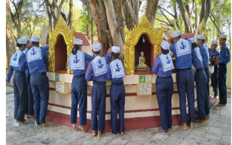
ရေကြောင်းလူငယ်နှင့် လေကြောင်းလူငယ် အခြေခံသင်တန်းများနှင့်တန်းမြင့်သင်တန်းများမှ သင်တန်းသား၊ သင်တန်းသူများ၊ နည်းပြ၊ အုပ်ချုပ်သူများ မဟာဗောဓိ ညောင်ပင်ကို ရေသွန်းလောင်းပူဇော်ကြစဉ်။

နေပြည်တော် ဧပြီ ၃၀ ကျောင်းသား၊ ကျောင်းသူ မျိုးဆက်သစ် လူငယ်မောင်မယ်များကို နွေရာသီ ကျောင်းပိတ်ရက်ကာလအတွင်း အသိ ပညာများဖွံ့ဖြိုးတိုးတက်စေရန် အားလပ် ရက်များအကျိုးရှိစေရန်၊ မိမိဝါသနာပါ သည့်ပညာရပ်များကိုလေ့လာဆည်းပူးနိုင် စေရန်နှင့် နိုင်ငံတော်အတွက် ရေကြောင်း ပညာ၊ လေကြောင်းပညာကျွမ်းကျင်သော အနာဂတ်မျိုးဆက်သစ် လူငယ်များ ပေါ်ထွန်းလာစေရန်ရည်ရွယ်၍ တပ်မတော် (ရှေ့)က ရေကြောင်းလူငယ်အခြေခံနှင့် တန်းမြင့်သင်တန်းများ၊ တပ်မတော်(လေ) က အခြေခံလေကြောင်းလူငယ်သင်တန်း နှင့် တန်းမြင့်လေကြောင်းလူငယ်သင်တန်း ဖွင့်ပွဲများကို ဧပြီ ၂၇ ရက်တွင် သက်ဆိုင်ရာ မြို့နယ်အသီးသီးရှိ သင်တန်းစခန်းများ၌ တစ်ပြိုင်တည်း စတင်ဖွင့်လှစ်ခဲ့ပြီး လေ့ကျင့်သင်ကြားပေးလျက်ရှိသည်။ ထိုသို့ လေ့ကျင့်သင်ကြားလျက်ရှိ