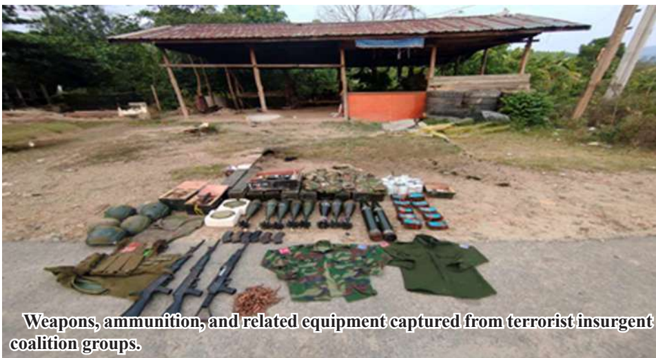
Weapons, ammunition, and related equipment captured from terrorist insurgent coalition groups.