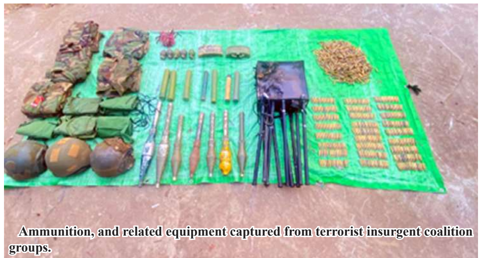
Ammunition, and related equipment captured from terrorist insurgent coalition groups.

Nay Pyi Taw April 30 Military columns have today completely recaptured and seized control of Indaw Township and the surrounding areas that had been temporarily under the control of terrorist insurgents. The NUG-aligned, so-called PDF terrorist insurgent coalition groups, in order to halt administrative mechanisms in towns and villages within the Mandalay and Sagaing Regions, have carried out acts including mining and bombing departmental buildings, hospitals, clinics, factories, and workshops; burning and destroying the homes of local residents; and using the religious buildings as temporary defensive positions to conduct terrorist activities. Consequently, local residents