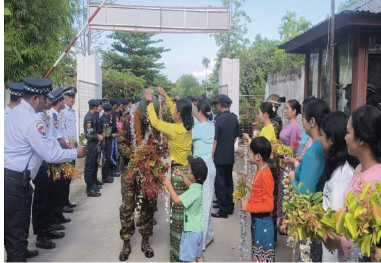
နေပြည်တော် ဧပြီ ၃၀ နိုင်ငံတော်တည်ငြိမ်ရေးနှင့် နယ်မြေ အေးချမ်းသာယာရေးတို့အတွက် စစ်ဆင် ရေးတာဝန်များ ထမ်းဆောင်ခဲ့သည့် ရှေ့တန်းပြန် နိုင်ငံ့သားကောင်းတပ်မတော် သားများကို သောင်းသောင်းဖြဖြဂုဏ်ပြု ကြိုဆိုစဉ်။