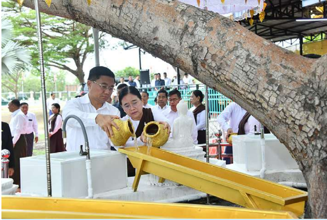
ဒုတိယတပ်မတော်ကာကွယ်ရေးဦးစီးချုပ် ကာကွယ်ရေးဦးစီးချုပ်(ကြည်း) ဗိုလ်ချုပ်ကြီးကျော်စွာလင်းနှင့် ဇနီး ဒေါ်နန်းကူးကူ မဟာဗောဓိညောင်ပင်တော်ကို ညောင်ရေသွန်းလောင်းပူဇော်ကြစဉ်။

အဆင့်မြင့်တပ်မတော်အရာရှိကြီးများနှင့် ဇနီးများ၊ အရာရှိ၊ အရာခံ၊ အကြပ်၊ စစ်သည်များနှင့် မိသားစုများက သတ်မှတ်ထားသည့် နေရာများအလိုက် နေရာယူကြပြီး မဟာဗောဓိညောင်ပင်တော်ကို ညောင်ရေသွန်းလောင်းပူဇော်ကြကာ အမွှေးနံ့သာရည်များ ပက်ဖျန်းပူဇော်ကြ၍ မဟာဗောဓိညောင်ပင်တော်အား လက်ယာရစ်လှည့်လည် ပူဇော်ကြသည်။