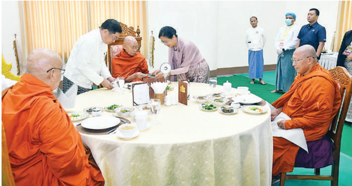
နိုင်ငံတော်သံဃမဟာနာယကအဖွဲ့ ဒုတိယဥက္ကဋ္ဌ မန္တလေးတိုင်းဒေသကြီး မိတ္ထီလာမြို့ သာသနဓဇပုလ္လကျောင်းတိုက် ပဓာနနာယကဆရာတော် အဂ္ဂမဟာပဏ္ဍိတ အဂ္ဂမဟာသဒ္ဓမ္မဇောတိကဇ ဘဒ္ဒန္တကောဝိဒ အမှူးပြုသည့် ဆရာတော်၊ သံဃာတော်တို့အား ဒုတိယသမ္မတ ဦးညိုစောနှင့် ဇနီးဒေါ်စမ်းစမ်းအေးတို့က နေ့ဆွမ်းဆက်ကပ်လှူဒါန်းစဉ်။

နေပြည်တော် ဧပြီ ၃၀ ကြသည်။ ၁၃၈၈ ခုနှစ် ကဆုန်လပြည့်(ဗုဒ္ဓနေ့) အထိမ်းအမှတ်အဖြစ် ဆင်ယင်ကျင်းပပူဇော်သည့် မဟာမင်္ဂလာအခမ်းအနားသို့ ကြွရောက်တော်မူကြသည့် ဆရာတော်ကြီးများအား လှူဖွယ်ပစ္စည်းများနှင့် နေ့ဆွမ်းဆက်ကပ်လှူဒါန်းခြင်း မင်္ဂလာအခမ်းအနားကို ယနေ့နံနက်ပိုင်းတွင် မာရဝိဇယဗုဒ္ဓဥယျာဉ်တော် ပရိဝုဏ်အတွင်းရှိ အဂ္ဂိမိပတိ သာသနာ့ဗိမာန်တော်ကြီး၌ ကျင်းပရာ ပြည်ထောင်စုသမ္မတမြန်မာနိုင်ငံတော် ဒုတိယသမ္မတ ဦးညိုစောနှင့် ဇနီး ဒေါ်စမ်းစမ်းအေး၊ ဒုတိယသမ္မတ ဒေါ်နန်းနီနီအေးတို့တက်ရောက်၍ လှူဖွယ်ပစ္စည်းများနှင့် နေ့ဆွမ်းဆက်ကပ်လှူဒါန်းကြသည်။