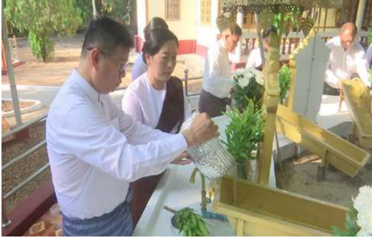
ကဆုန်လပြည့်(ဗုဒ္ဓနေ့)တွင် နေပြည်တော်တိုင်းစစ်ဌာနချုပ် တိုင်းမှူး ဗိုလ်ချုပ်ကြည်သိုက် ကဆုန်ညောင်ရေသွန်းလောင်းပူဇော်စဉ်။