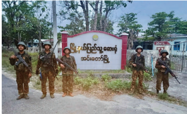
တပ်မတော်စစ်ကြောင်းများက အကြမ်းဖက်သောင်းကျန်းသူပူးပေါင်းအဖွဲ့များ ယာယီစိုးမိုးထားသည့် အင်းတော်မြို့ မြို့နယ်ပြည်သူ့ဆေးရုံ ပြန်လည်သိမ်းပိုက်ရရှိခဲ့မှု မှတ်တမ်းဓာတ်ပုံ။