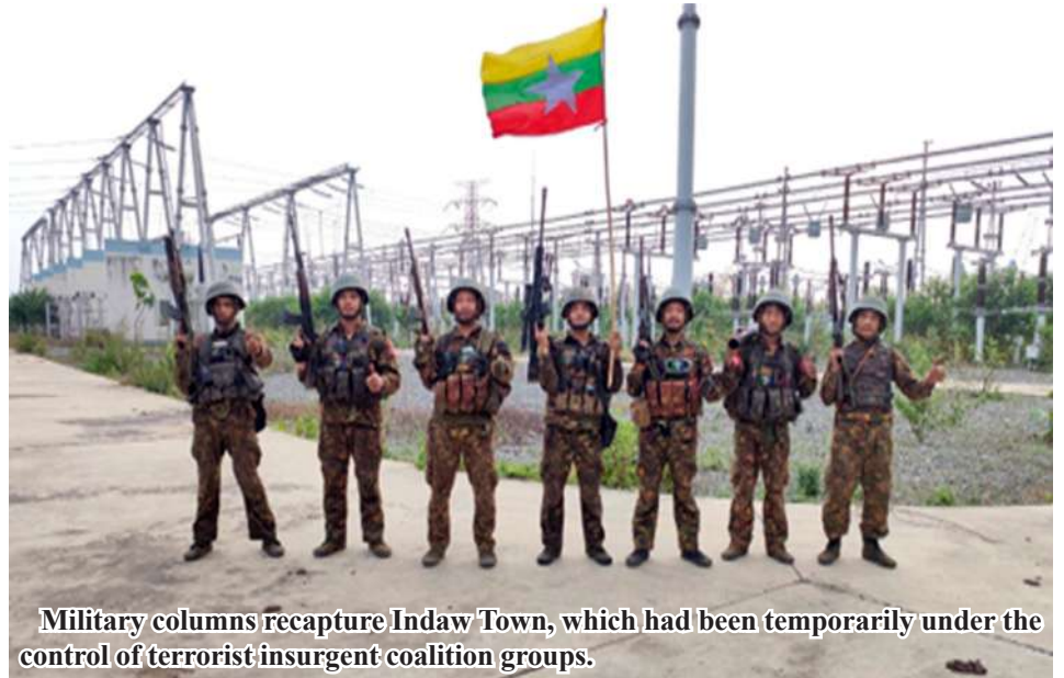
Military columns recapture Indaw Town, which had been temporarily under the control of terrorist insurgent coalition groups.