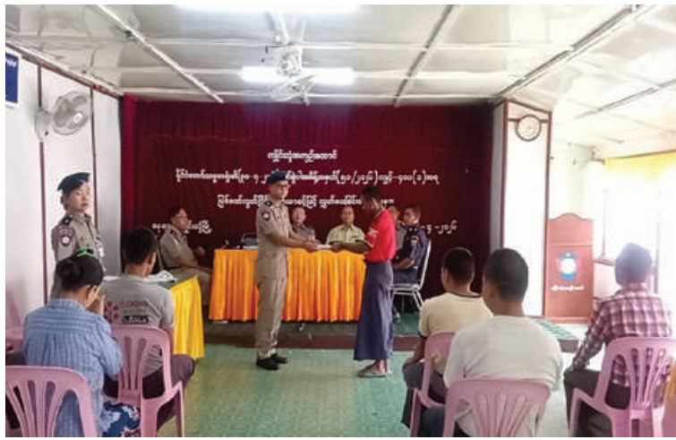
ကျိုင်းတုံအကျဉ်းထောင်မှ ပြစ်ဒဏ်လွတ်ငြိမ်းခွင့်ရသူများကို တာဝန်ရှိသူများက ထောင်လွတ်လက်မှတ်များ ပေးအပ်စဉ်။

နေပြည်တော် ဧပြီ ၃၀ အကျဉ်းထောင်၊ အချုပ်ထောင်၊ စခန်းအသီးသီးတွင် အကျဉ်းကျခံနေကြရသော နိုင်ငံသားအကျဉ်းသား၊ အကျဉ်းသူ ၁၅၀၈ ဦးနှင့် နိုင်ငံခြားသား အကျဉ်းသား၊ အကျဉ်းသူ ၁၁ ဦး စုစုပေါင်း ၁၅၁၉ ဦးတို့ကို ယနေ့တွင် ပြစ်ဒဏ် လွတ်ငြိမ်းခွင့်ပြုခဲ့ကြောင်း သိရသည်။ ယနေ့တွင် တိုင်းဒေသကြီးနှင့် ပြည်နယ်အသီးသီးရှိ အကျဉ်းထောင်၊ အချုပ်ထောင်၊ စခန်းအသီးသီးမှ အကျဉ်းကျခံနေကြသော အကျဉ်းသား၊ အကျဉ်းသူ ၁၅၀၈ ဦးတို့ကို ရာဇဝတ်ကျင့်ထုံး