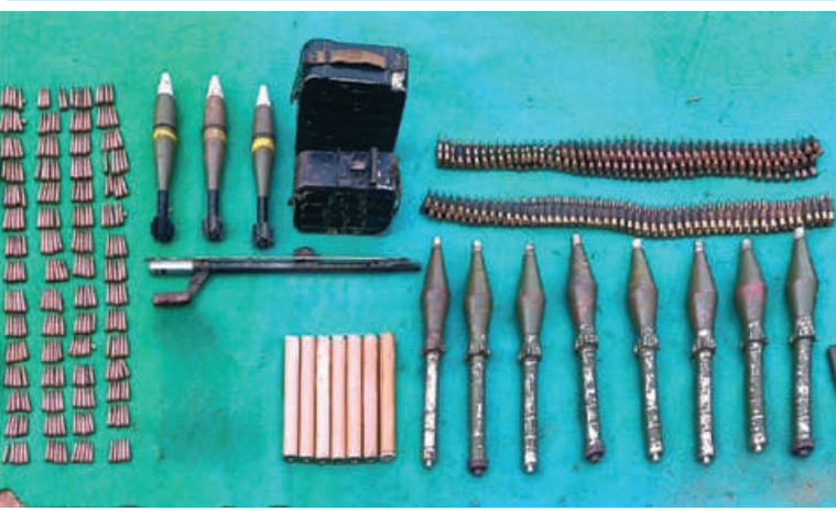
အကြမ်းဖက်သောင်းကျန်းသူပူးပေါင်းအဖွဲ့များထံမှ သိမ်းပိုက်ရရှိသည့် လက်နက်၊ ခဲယမ်းနှင့် ဆက်စပ်ပစ္စည်းများကို တွေ့ရစဉ်။

ဟန်ချက်ညီညီပေါင်းစပ်ပြီး ပြန်လည် ထိုးစစ်ဆင်တိုက်ခိုက်ခဲ့ရာ အကြမ်းဖက် သမားများ ယာယီစိုးမိုးထားသော မန္တလေး-မတ္တရာ-စဉ့်ကူး-သပိတ်ကျင်း လမ်းကြောင်းနှင့် တကောင်းမြို့တို့အား ပြန်လည်ထိန်းချုပ်နိုင်ခဲ့သည့် သတင်း များကို ထုတ်ပြန်ခဲ့ပြီးဖြစ်ပါသည်။ ဆက်လက်၍ တပ်မတော်စစ်ကြောင်း အနေဖြင့် အောင်မြင်မှုများ ဆက်တိုက်ရရှိ