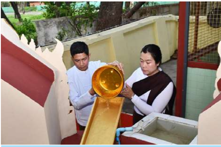
ကဆုန်လပြည့်(ဗုဒ္ဓနေ့)တွင် အလယ်ပိုင်းတိုင်းစစ်ဌာနချုပ် တိုင်းမှူး ဗိုလ်မှူးချုပ်အောင်ဌေး နန်းမြို့ဆုတောင်းပြည့်ဘုရား၌ ကဆုန်ညောင်ရေသွန်းလောင်းပူဇော်စဉ်။