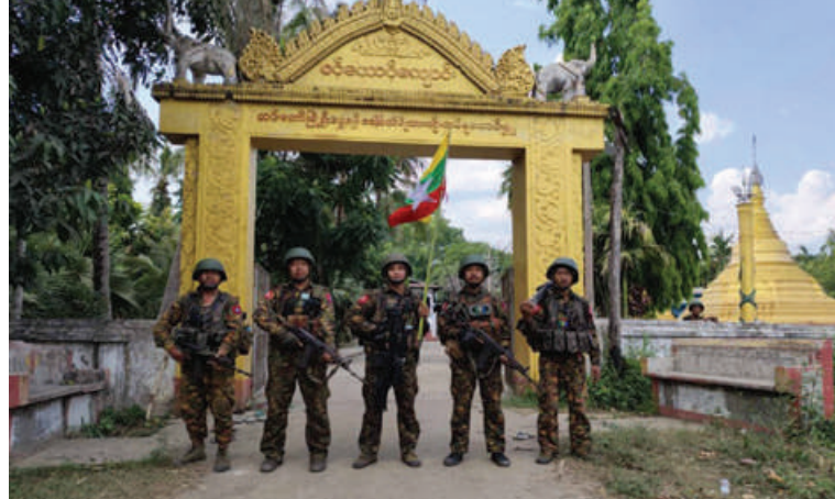
တပ်မတော်စစ်ကြောင်းများက အကြမ်းဖက်သောင်းကျန်းသူပူးပေါင်းအဖွဲ့များ ယာယီစိုးမိုးထားသည့် အင်းတော်မြို့ရှိ ဘုန်းတော်ကြီးကျောင်းအား ပြန်လည် သိမ်းပိုက်ရရှိခဲ့မှု မှတ်တမ်းဓာတ်ပုံ။