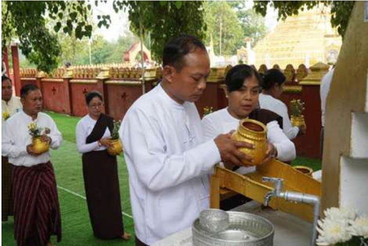
ကဆုန်လပြည့်(ဗုဒ္ဓနေ့)၌ တြိဂံဒေသတိုင်းစစ်ဌာနချုပ် တိုင်းမှူး ဗိုလ်ချုပ်စိုးမြတ်ထွဋ် မဟာဗောဓိညောင်ပင်အား ညောင်ရေသွန်းလောင်းပူဇော်စဉ်။