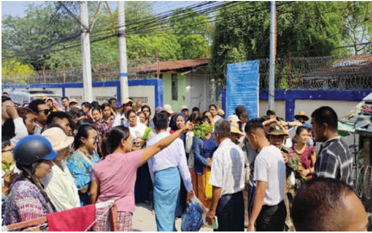
မန္တလေးဗဟိုအကျဉ်းထောင်မှ အကျဉ်းသား၊ အကျဉ်းသူ ၉၁ ဦး ပြစ်ဒဏ် လွတ်ငြိမ်းခွင့်ဖြင့် ပြန်လည်လွတ်မြောက်လာမှုကို တွေ့ရစဉ်။