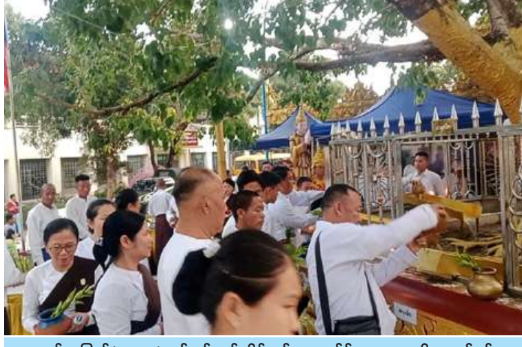
ကဆုန်လပြည့်(ဗုဒ္ဓနေ့)တွင် ရန်ကုန်တိုင်းစစ်ဌာနချုပ်၌ မဟာဗောဓိညောင်ပင်အား ရေစင်သွန်းလောင်းပူဇော်ကြစဉ်။

နေပြည်တော် ဧပြီ ၃၀ ကဆုန်လပြည့်နေ့ဖြစ်သည့် ယနေ့သည် ဘုရားအလောင်းတော်သုမေမာရင် ရသေ့ဘဝတွင် ဒီပင်္ကရာမြတ်စွာဘုရား ခြေတော်ရင်း၌ နိယတဗျာဒိတ်ပန်းဆင်