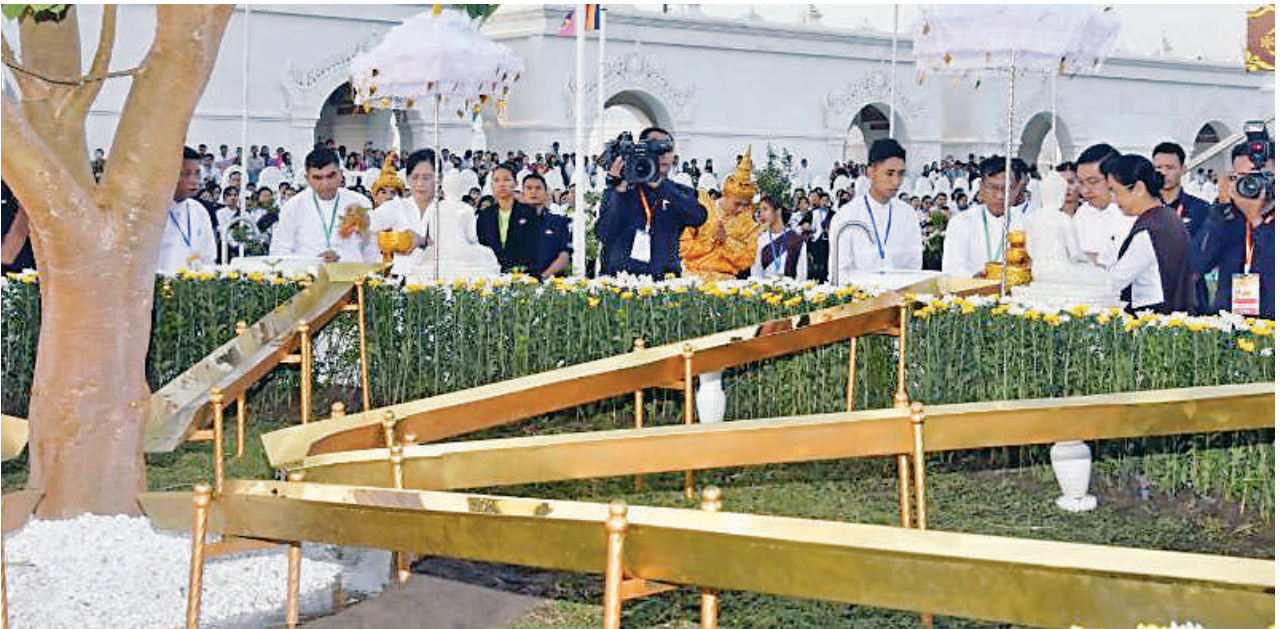
ဒုတိယသမ္မတ ဦးညိုစောနှင့် ဇနီး ဒေါ်စမ်းစမ်းအေး၊ ဒုတိယသမ္မတ ဒေါ်နန်းနီနီအေးတို့ မဟာဗောဓိညောင်ပင်တော်အား အမွှေးနံ့သာရည်များ ပတ်ဖျန်းပူဇော်ကာ ညောင်ရေသွန်းလောင်းပူဇော်ကြစဉ်။

အခမ်းအနားသို့ ပြည်ထောင်စုတရားသူကြီးချုပ် ဦးသာဌေး၊ နိုင်ငံတော်ဖွံ့ဖြိုးရေးအဖွဲ့ဝန်ထမ်းများ၊ အစိုးရအဖွဲ့ဝန်ထမ်းများ၊ နိုင်ငံခြားသံတော်များ၊ နိုင်ငံခြားသံရုံးများ၊ နိုင်ငံခြားသံရုံးများ၊ ဒုတိယတပ်မတော်ကာကွယ်ရေးဦးစီးချုပ် ကာကွယ်ရေးဦးစီးချုပ် (ကြည်း) ဗိုလ်ချုပ်ကြီးကျော်စွာလင်းနှင့် ဇနီး၊ ပြည်ထောင်စုဝန်ကြီးများ နှင့် ဇနီးများ၊ ကာကွယ်ရေးဦးစီးချုပ်(ရေ)၊ ကာကွယ်ရေးဦးစီးချုပ်(လေ)၊ နေပြည်တော်ကောင်စီဥက္ကဋ္ဌ ညိုနှိုင်းကွဲကဲရေးမှူး (ကြည်း)၊ ရေ၊ လေ၊ ကာကွယ်ရေးဦးစီးချုပ်ရုံးမှ အဆင့်မြင့်တပ်မတော်အရာရှိကြီးများ၊ ဒုတိယဝန်ကြီးနှင့် တာဝန်ရှိသူများ၊ ဝတ်အသင်းအဖွဲ့များ၊ အရာထမ်း အမှုထမ်းများ တက်ရောက်ကြသည်။ စာမျက်နှာ ၂၀ ကော်လံ ၁ ☆