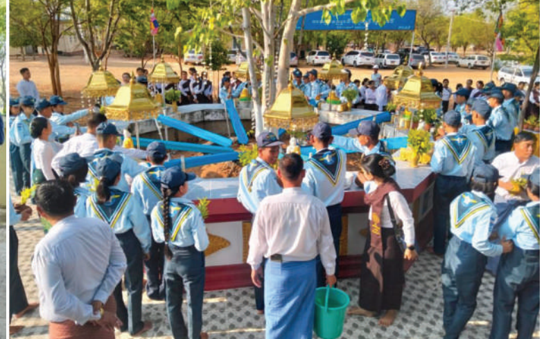
သက်ဆိုင်ရာမြို့နယ်အသီးသီးရှိ တန်ခိုးကြီး ဘုရား၊ စေတီပုထိုးများသို့သွားရောက်ပြီး မဟာဗောဓိညောင်ပင်ကို ရေသွန်း လောင်းပူဇော်ခြင်း၊ ပန်း၊ ရေချမ်းကပ်လှူ

ခရစ်နှစ် ၂၀၂၆ ခုနှစ် ဧပြီ ၃၀ ရက် မြန်မာသက္ကရာဇ် ၁၃၈၈ ခုနှစ် ကဆုန် လပြည့်နေ့တွင်ကျရောက်သည့် ကဆုန် ညောင်ရေသွန်းလောင်းပူဇော်ပွဲနေ့တွင်