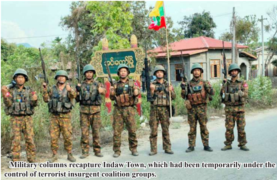
Military columns recapture Indaw Town, which had been temporarily under the control of terrorist insurgent coalition groups.