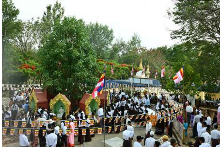
ကဆုန်လပြည့်(ဗုဒ္ဓနေ့)တွင် အရှေ့ပိုင်းတိုင်းစစ်ဌာနချုပ်၌ ညောင်ရေသွန်းလောင်းပူဇော်ပွဲကျင်းပစဉ်။