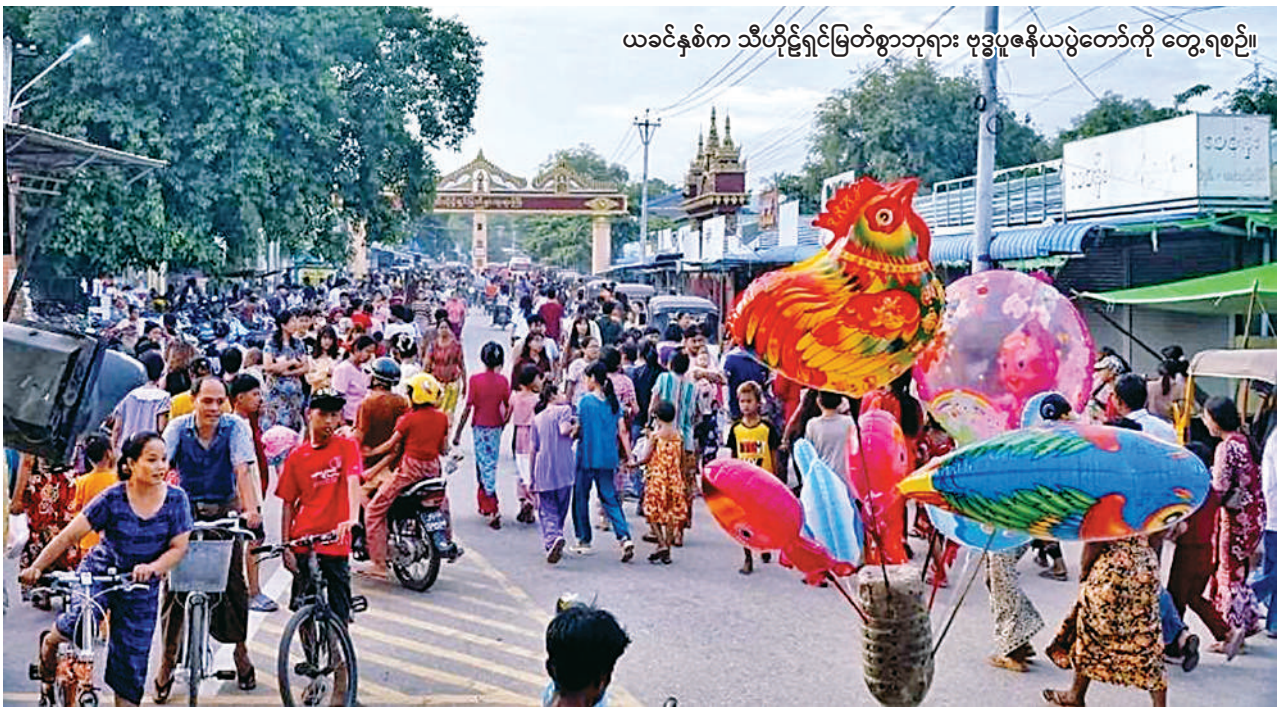
ယခင်နှစ်က သီဟိုဠ်ရှင်မြတ်စွာဘုရား ဗုဒ္ဓပူဇော်ပွဲတော်ကို တွေ့ရစဉ်။

ထို့ပြင် ဧပြီ ၃၀ ရက် ညပိုင်းတွင် ကျင်းပပြုလုပ်မည့် ဓမ္မသဘင်အခမ်းအနားကို MRTV HD Channel မှလည်း ည ၈ နာရီသတင်းအပြီးတွင် Delay ထုတ်လွှင့်ပြသမည်ဖြစ်ကြောင်း သတင်းရရှိသည်။ (သတင်းစဉ်)