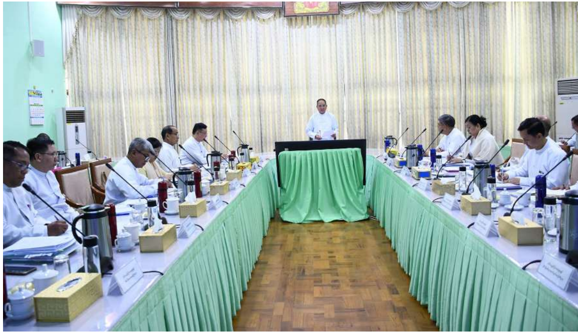
နေပြည်တော် ဧပြီ ၂၈ - နိုင်ငံတော်သမ္မတ၏ လမ်းညွှန်မှာကြားချက်များနှင့် အစိုးရ၏ ရက် ၁၀၀ အတွင်း ဦးစားပေးဆောင်ရွက်မည့် စီမံကိန်းများ အကောင်အထည်ဖော်နိုင်ရေးလုပ်ငန်းညှိနှိုင်းအစည်းအဝေးကို ယနေ့မွန်းလွဲပိုင်းတွင် အမျိုးသားစီမံကိန်း၊ ရင်းနှီးမြှုပ်နှံမှုနှင့် နိုင်ငံခြားစီးပွား ဝန်ကြီးဦးအောင်ကျော်ဟိုး၊ ဒုတိယ

ဝန်ကြီးများဖြစ်ကြသည့် ဦးကျော်ထင်နှင့် ဦးသန့်စင်လွင်၊ အမြဲတမ်းအတွင်းဝန်နှင့် ဌာနဆိုင်ရာတာဝန်ရှိသူများ တက်ရောက်ကြသည်။ ဦးစွာပြည်ထောင်စုဝန်ကြီးက နိုင်ငံတော်သမ္မတ၏ လမ်းညွှန်မှာကြားချက်ဖြစ်သည့် တိုင်းပြည်တည်ငြိမ်အေးချမ်းမှုရှိရေးနှင့် ဖွံ့ဖြိုးတိုးတက်မှုရရှိရေးကို အလေးထား၍ ဦးစားပေးဆောင်ရွက်သွားရန်ဖြစ်ကြောင်း၊ မိမိတို့ဝန်ကြီးဌာနအနေဖြင့် အစိုးရ၏ ရက် ၁၀၀ အတွင်း ဆောင်ရွက်မည့် စီမံကိန်းများကို ဒေသန္တရစီမံကိန်း၊ ကဏ္ဍစီမံကိန်းဖြင့် ချိတ်ဆက်စိစစ်၍ အမျိုးသားစီမံကိန်းပါ လုပ်ငန်းစဉ်များကို ဆောင်ရွက်သွားကြရန် လိုကြောင်း၊ နိုင်ငံ၏စီးပွားရေး၊ ပညာရေး၊ ကျန်းမာရေးနှင့် လူမှုရေးကဏ္ဍများနှင့်စပ်လျဉ်း၍ အမျိုးသားစီမံကိန်းဥပဒေနှင့် ဒေသန္တရစီမံကိန်းဥပဒေပါ လုပ်ငန်းစီမံကိန်းနှင့် လုပ်ငန်းများ၏ အကောင်အထည်ဖော်မှုအခြေအနေများကို မြေပြင်ကွင်းဆင်းစိစစ်ပြီး အစီရင်ခံစာပြုစုတင်ပြခြင်း၊ GDP ဖွံ့ဖြိုးတိုးတက်ရေးကို အထောက်အကူပြုသည့် ထုတ်လုပ်မှုနှင့်ဝန်ဆောင်မှုလုပ်ငန်းများအတွက် အသုံးပြုနေသော ငွေလုံးငွေရင်းအသုံးစရိတ်များနှင့် စပ်လျဉ်း၍ စိစစ်ခြင်းများ ဆောင်ရွက်ပေးသွားမည်ဖြစ်ကြောင်း၊ ရင်းနှီးမြှုပ်နှံမှုများ လွယ်ကူချောမွေ့စေရေးနှင့် ပိုမိုဝင်ရောက်လာစေရေးအတွက် ရင်းနှီးမြှုပ်နှံမှုနှင့်ဆက်စပ်သည့် ဌာန၊ အဖွဲ့အစည်းများ၊ လုပ်ငန်းရှင်များကို အသိပညာမျှဝေပေးနိုင်ရေး၊ ရင်းနှီးမြှုပ်နှံမှုများ၏ လိုအပ်ချက်များကို ဥပဒေ၊ လုပ်ထုံးလုပ်နည်းများနှင့်အညီ ဆောင်ရွက်ပေးနိုင်ရေး ပေါင်းစပ်ညှိနှိုင်းခြင်းများ ဆောင်ရွက်သွားရမည်ဖြစ်ကြောင်းဖြင့် မှာကြားခဲ့ကြောင်း သတင်းရရှိသည်။ (သတင်းစဉ်)