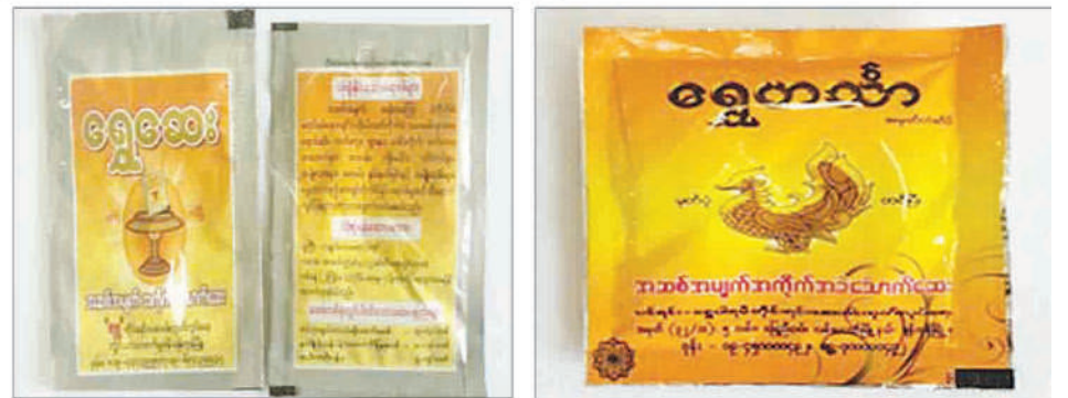
Paracetamol & Diclofenac ရောနှောသည့် ဆေးထုပ်နမူနာများ

၅။ တိုင်းရင်းဆေးဝါးထုတ်လုပ်ဖြန့်ဖြူးသည့် လုပ်ငန်းများနှင့် ဆေးဝါးရောင်းချသည့် ဆေးဆိုင်များသည် တိုင်းရင်းဆေးပညာဦးစီးဌာနတွင် မှတ်ပုံတင်ထားခြင်းမရှိသော တိုင်းရင်းဆေးဝါးများ၊ ဆေးဝါးအတုများ၊ စံမညီတိုင်းရင်းဆေးဝါးများ၊ အများပြည်သူသုံးစွဲရန်မသင့်ကြောင်း ကြေညာထားသည့် တိုင်းရင်းဆေးဝါးများ တင်သွင်းဖြန့်ဖြူးရောင်းချခြင်းများကို ကျင့်ဝတ်(Ethic)အရ လုံးဝ(လုံးဝ) မပြုလုပ်ရန်နှင့် လိုက်နာဆောင်ရွက်ခြင်းမရှိပါက တိုင်းရင်းဆေးဝါးဥပဒေပုဒ်မ (၃၁)၊ (၃၂) အရ တရားစွဲဆို အရေးယူမည်ဖြစ်ကြောင်း အသိပေးအပ်ပါသည်။