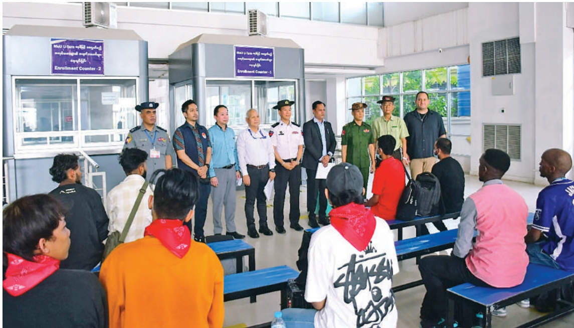
အွန်လိုင်းလိမ်လည်မှု (Telecom Fraud) နှင့် ဒုစရိုက်မှုလုပ်ငန်းများတွင် ဆက်စပ်ပါဝင်ခဲ့ကြသည့် ပြည်ပနိုင်ငံသား ၁၄ ဦးကို သက်ဆိုင်ရာနိုင်ငံများသို့ ထပ်မံလွှဲပြောင်းပေးအပ်စဉ်။

နေပြည်တော် ဧပြီ ၂၈ ထိုင်းနိုင်ငံအပါအဝင် အိမ်နီးချင်းနိုင်ငံအချို့ကို တစ်ဆင့်ခံဖြတ်သန်း၍ မြန်မာနိုင်ငံအတွင်းသို့ နယ်စပ်လမ်းကြောင်းများမှ တရားမဝင် ဝင်ရောက်လာပြီး ကရင်ပြည်နယ် မြဝတီ-ရွှေကုက္ကိုလ်နယ်မြေတွင် တရားမဝင် အွန်လိုင်းလောင်းကစားမှုများ၊ အွန်လိုင်းလိမ်လည်မှုများ၊ ဒုစရိုက်မှုများကျူးလွန်ခဲ့ကြသည့် အိန္ဒိယနိုင်ငံသား လေးဦး၊ အင်ဒိုနီးရှားနိုင်ငံသား လေးဦး၊ ဘင်္ဂလားဒေ့ရှ်နိုင်ငံသား သုံးဦး၊ ဘူဂ္ဂလန်နိုင်ငံသား တစ်ဦး၊ ရဝမ်ဒါနိုင်ငံသား တစ်ဦးနှင့် လာအိုနိုင်ငံသား တစ်ဦး စုစုပေါင်း ပြည်ပနိုင်ငံသား ၁၄ ဦးတို့ကို မြန်မာ-ထိုင်း အမှတ်(၂)ချစ်ကြည်ရေးတံတားမှတစ်ဆင့် သက်ဆိုင်ရာနိုင်ငံများသို့ လူသားချင်းစာနာထောက်ထားမှုနှင့် စာမျက်နှာ ၂၀ ကော်လံ ၁ ☆