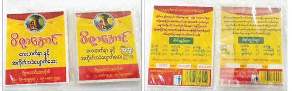
တိုင်းရင်းဆေးဝါး မှတ်ပုံတင်ထားခြင်းမရှိသည့် ဆေးဝါးနမူနာ

၃။ အများပြည်သူတို့အနေဖြင့် ကျန်းမာရေးဝန်ကြီးဌာန၊ တိုင်းရင်းဆေးပညာဦးစီးဌာနတွင် မှတ်ပုံတင်ထားခြင်းမရှိသော တိုင်းရင်းဆေးဝါးများကို ဝယ်ယူသုံးစွဲခြင်းမပြုကြရန်နှင့် တိုင်းရင်းဆေးပညာဦးစီးဌာနတွင် မှတ်ပုံတင်ထားသော ဆေးဝါးများကိုသာ စိစစ်ဝယ်ယူသုံးစွဲရန် နှိုးဆော်အပ်ပါသည်။