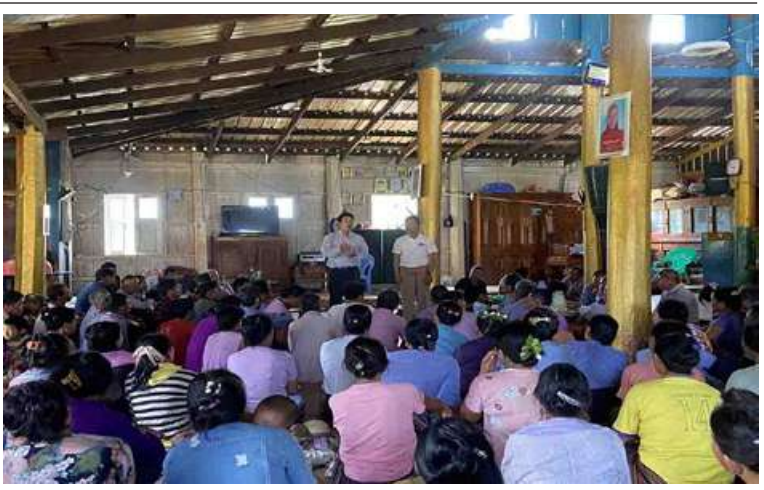
ရှေးချမ်းဖွံ့ဖြိုးစည်းပေးခဲ့ပြီး ကျေးရွာဖွံ့ဖြိုး ကျေးရွာသားများကိုယ်တိုင် အကောင် ရေးလုပ်ငန်းများကို စီမံကိန်းရန်ပုံငွေကျပ် အထည်ဖော် ဆောင်ရွက်သွားမည် သိန်း ၁၅၀ ပြင် ဌာနမှဝန်ထမ်းများက ဖြစ်ကြောင်း သိရသည်။ နည်းပညာပံ့ပိုးပေးကာ ကျေးရွာသူ၊ သံသာ

သတ်မှတ်ချက်များ၊ ကော်မတီဝင်များ၏ တာဝန်နှင့်ရပိုင်ခွင့်များ၊ စီမံကိန်းအကောင် အထည်ဖော်ဆောင်ရွက်ရာတွင် ကျေးရွာ ပြည်သူ့လူထုက ပူးပေါင်းပါဝင်ဆောင်ရွက် ပေးရမည့်အခြေအနေများကို ရှင်းလင်း ပြောကြားသည်။ ထို့နောက်အခမ်းအနားသို့ တက်ရောက် လာကြသော ကျေးရွာတာဝန်ရှိသူများ ကျေးရွာသူ၊ ကျေးရွာသားများက ကျေးရွာဖွံ့ဖြိုးရေးလုပ်ငန်း ကော်မတီဝင် ခုနစ်ဦးကို အများသဘောဆန္ဒနှင့်အညီ