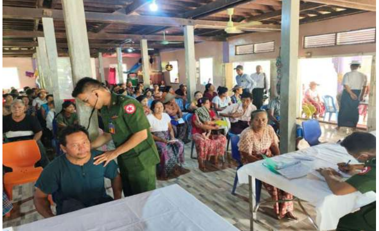
ရန်ကုန်တိုင်းစစ်ဌာနချုပ် နယ်လှည့်ဆေးကုသရေးအဖွဲ့က ဒေသခံပြည်သူများကို ကျန်းမာရေးစောင့်ရှောက်မှုလုပ်ငန်းများ ဆောင်ရွက်ပေးစဉ်။

တစ်ဖက်တစ်လမ်းက ကူညီစောင့်ရှောက်မှုများ ဆောင်ရွက်ပေးလျက်ရှိရာ တိုင်းဒေသကြီးနှင့် ပြည်နယ်အသီးသီးရှိ တပ်မတော် နယ်လှည့်ဆေးကုသရေးအဖွဲ့များက ဒေသအသီးသီးရှိ ဒေသခံတိုင်းရင်းသားပြည်သူများကို ၎င်းတို့၏ မြို့နယ်၊ ကျေးရွာများအရောက်သွားရောက်၍ လူမျိုး၊ ဘာသာမရွေး ဆေးကုသပေးခြင်းများ ဆောင်ရွက်ပေးလျက်ရှိသည်။ ထိုသို့ဆောင်ရွက်ပေးလျက်ရှိရာ ယနေ့တွင် ရန်ကုန်တိုင်းစစ်ဌာနချုပ် နယ်လှည့်ဆေးကုသရေးအဖွဲ့က ရန်ကုန်တိုင်းဒေသကြီး တိုက်ကြီးမြို့နယ် ဥက္ကံမြို့ ရှမ်းစုကျေးရွာရှိ အောင်မြေရတနာကျောင်းတိုက်၌အခြေပြု၍ အဆိုပါကျေးရွာနှင့် ပတ်ဝန်းကျင်ကျေးရွာများရှိ သံဃာ