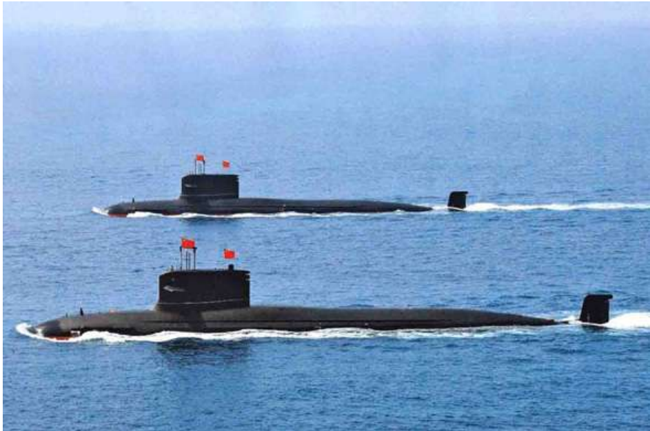
Type 095 SSGNs ကို တွေ့ရစဉ်။

တရုတ်နိုင်ငံသည် ထိုသို့အဆင့်မြင့်တင်တည် ဆောက်မှုများရှိနေသည့်တိုင်အောင် မျှော်လင့်ချက်များ