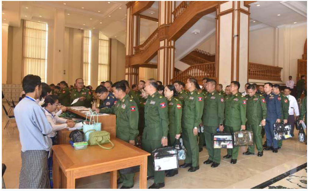
တတိယအကြိမ် ပြည်ထောင်စုလွှတ်တော် ပထမပုံမှန်အစည်းအဝေး ပဉ္စမနေ့သို့ တက်ရောက်ကြောင်း တပ်မတော်သားလွှတ်တော်ကိုယ်စားလှယ်များ လက်မှတ်ရေးထိုးစဉ်။

ရှေ့ဖုံးမှအဆက် တင်ပြထားသော နိုင်ငံတော်ဖွဲ့စည်းပုံအခြေခံ ဥပဒေဆိုင်ရာခုံရုံးအဖွဲ့ဝင် ကိုးဦးတို့၏အမည် စာရင်းများကို လွှတ်တော်သို့တင်ပြခဲ့ပြီးဖြစ်ကြောင်း ပြောကြားပြီး အဆိုပါပုဂ္ဂိုလ်များနှင့် စပ်လျဉ်း၍ ကန့်ကွက်ချက်တစ်စုံတစ်ရာမရှိသဖြင့် လွှတ်တော်သို့ တင်ပြထားသည့် ဦးအောင်ဇော်သိန်းဦးဥက္ကဋ္ဌအဖွဲ့ဝင်များ ဦးကျော်ဆန်းဦးတူးမော်ဒေါ်စုဝင်းဒေါ်ဥမ္မာအေး၊ ဦးတင့်ဝေနှင့် ဒေါက်တာမာလာမော်တို့ကို နိုင်ငံတော်ဖွဲ့စည်းပုံအခြေခံဥပဒေဆိုင်ရာခုံရုံးအဖွဲ့ဝင်များအဖြစ်လည်းကောင်း၊ ယင်းအဖွဲ့မှ ဦးအောင်ဇော်သိန်းကို နိုင်ငံတော်ဖွဲ့စည်းပုံအခြေခံဥပဒေဆိုင်ရာ ခုံရုံးဥက္ကဋ္ဌအဖြစ်လည်းကောင်း ခန့်အပ်တာဝန်ပေးရန် လွှတ်တော်ကသဘောတူကြောင်း ကြေညာသည်။