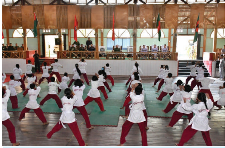
တောင်ပိုင်းတိုင်းစစ်ဌာနချုပ် တိုင်းမှူး ဗိုလ်မှူးချုပ်သူရဇော်လွင်စိုး မြန်မာ့သိုင်း သင်တန်းသားများ၏ မြန်မာ့သိုင်းကွက်များ၊ သရုပ်ဖော်ပြသမှုများကို ကြည့်ရှုအားပေးစဉ်။

နေပြည်တော် ဧပြီ ၉ - တောင်ပိုင်းတိုင်း စစ်ဌာနချုပ်၏ တပ်မတော်သားမိသားစုဝင် သားသမီး များ နေရာသီကျောင်းပိတ်ရက်များတွင် အားလပ်ချိန်ကို အကျိုးရှိစွာအသုံးပြုတတ် စေရန်၊ ဘာသာ၊ သာသနာကို တန်ဖိုးထား တတ်စေရန်နှင့် ယဉ်ကျေးလိမ္မာသည့် သားကောင်း၊ သမီးကောင်းများအဖြစ် သာမက မိမိပတ်ဝန်းကျင်၊ မိမိနိုင်ငံ အတွက် အကျိုးပြုနိုင်ပြီး ဘာသာ သာသနာကို အရှည်တည်တံ့တိုးတက်