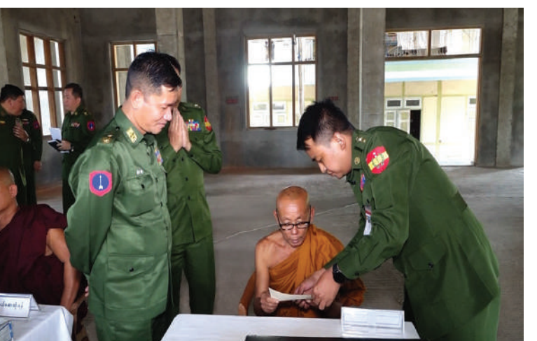
သံဃာတော်များအား ကျန်းမာရေးစောင့်ရှောက်မှုလုပ်ငန်းများ ဆောင်ရွက်ပေးနေ မှုကို မြောက်ပိုင်းတိုင်းစစ်ဌာနချုပ် တိုင်းမှူး ဗိုလ်ချုပ်အောင်ဇော်ထွေး ကြည့်ရှုအားပေးစဉ်။

နေပြည်တော် ဧပြီ ၉ - တပ်မတော်အနေဖြင့် တိုင်းရင်းသား ပြည်သူများ၏ ကျန်းမာရေးစောင့်ရှောက်မှု လုပ်ငန်းများတွင် နိုင်ငံတော်အစိုးရနှင့် အတူ တစ်ဖက်တစ်လမ်းမှ ကူညီစောင့် ရှောက်မှုများ ဆောင်ရွက်ပေးလျက်ရှိရာ တိုင်းဒေသကြီးနှင့် ပြည်နယ်အသီးသီးရှိ တပ်မတော် နယ်လှည့်ဆေးကုသရေး အဖွဲ့များက ဒေသအသီးသီးရှိ ဒေသခံ တိုင်းရင်းသားပြည်သူများကို ၎င်းတို့၏ မြို့နယ်၊ ကျေးရွာများအရောက် သွားရောက်၍ လူမျိုး၊ ဘာသာမရွေး ဆေးကုသပေးခြင်းများ ဆောင်ရွက်ပေး လျက်ရှိသည်။ ထိုသို့ ဆောင်ရွက်ပေးလျက်ရှိရာ ယနေ့တွင် မြောက်ပိုင်းတိုင်းစစ်ဌာနချုပ် နယ်လှည့်ဆေးကုသရေးအဖွဲ့က ကချင် ပြည်နယ် မြစ်ကြီးနားမြို့ရှိ ခရမ်းကျောင်း တိုက်၌အခြေပြု၍ အဆိုပါမြို့ပေါ်ရှိ သံဃာတော် ၂၂ ပါးတို့ကို ခွဲစိတ်ကုသမှု