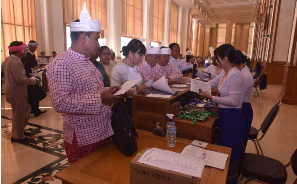
တတိယအကြိမ် ပြည်ထောင်စုလွှတ်တော် ပထမပုံမှန်အစည်းအဝေး ပဉ္စမနေ့သို့ တက်ရောက်ကြောင်း လွှတ်တော်ကိုယ်စားလှယ်များ လက်မှတ်ရေးထိုးစဉ်။