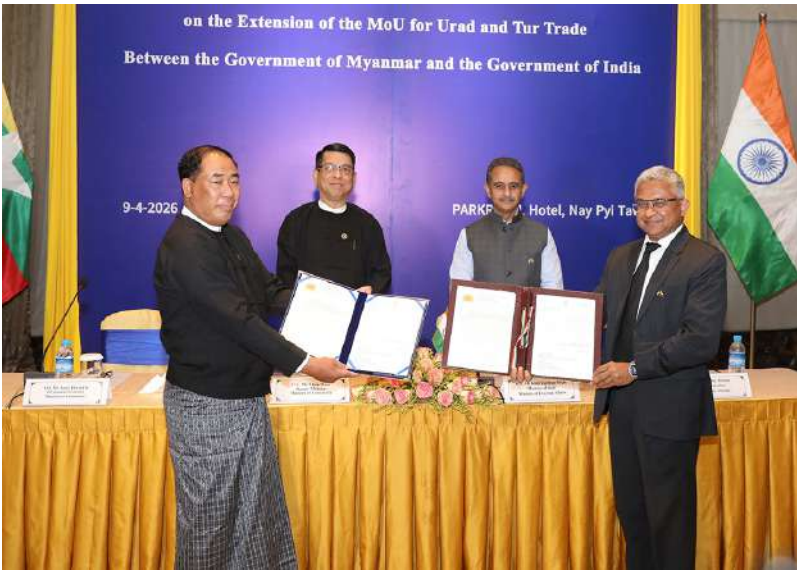
အိန္ဒိယသံအမတ်ကြီး H. E. Sh. Abhay Thakur တို့က မတ်ပဲနှင့် ပဲစင်းငုံကုန်သွယ်မှုပူးပေါင်းဆောင်ရွက်ရေးဆိုင်ရာ နားလည်မှုစာချုပ်သွင်းသက်တမ်းတိုးမြှင့်သည့် အပြန်အလှန်အတည်ပြုလွှာကို လဲလှယ်ကြသည်။ မြန်မာနိုင်ငံ စီးပွားရေးနှင့် ကူးသန်းရောင်းဝယ်ရေးဝန်ကြီးဌာနနှင့် အိန္ဒိယနိုင်ငံ

နေပြည်တော် ဧပြီ ၉ မြန်မာနိုင်ငံနှင့် အိန္ဒိယနိုင်ငံတို့အကြား မတ်ပဲနှင့်ပဲစင်းငုံကုန်သွယ်မှုပူးပေါင်းဆောင်ရွက်ရေးဆိုင်ရာ နားလည်မှုစာချုပ်သွင်းသက်တမ်းတိုးမြှင့်သည့် အပြန်အလှန်အတည်ပြုလွှာ (Exchange of Letters) လဲလှယ်သည့်အခမ်းအနားကို ယနေ့ညပိုင်းက နေပြည်တော်ရှိ Park Royal Hotel ၌ ကျင်းပသည်။ ဦးစွာ စီးပွားရေးနှင့် ကူးသန်းရောင်းဝယ်ရေးဝန်ကြီးဌာန ဒုတိယဝန်ကြီး ဦးမင်းမင်းနှင့် အိန္ဒိယသမ္မတနိုင်ငံ ပြည်ပရေးရာဝန်ကြီးဌာန ဒုတိယဝန်ကြီး H. E. Mr. Kirit Vardhan Singh တို့က အမှာစကားပြောကြားကြသည်။ ထို့နောက်စီးပွားရေးနှင့် ကူးသန်းရောင်းဝယ်ရေးဝန်ကြီးဌာန အမြဲတမ်းအတွင်းဝန် ဦးအောင်သွင်ဦးနှင့် မြန်မာနိုင်ငံဆိုင်ရာ