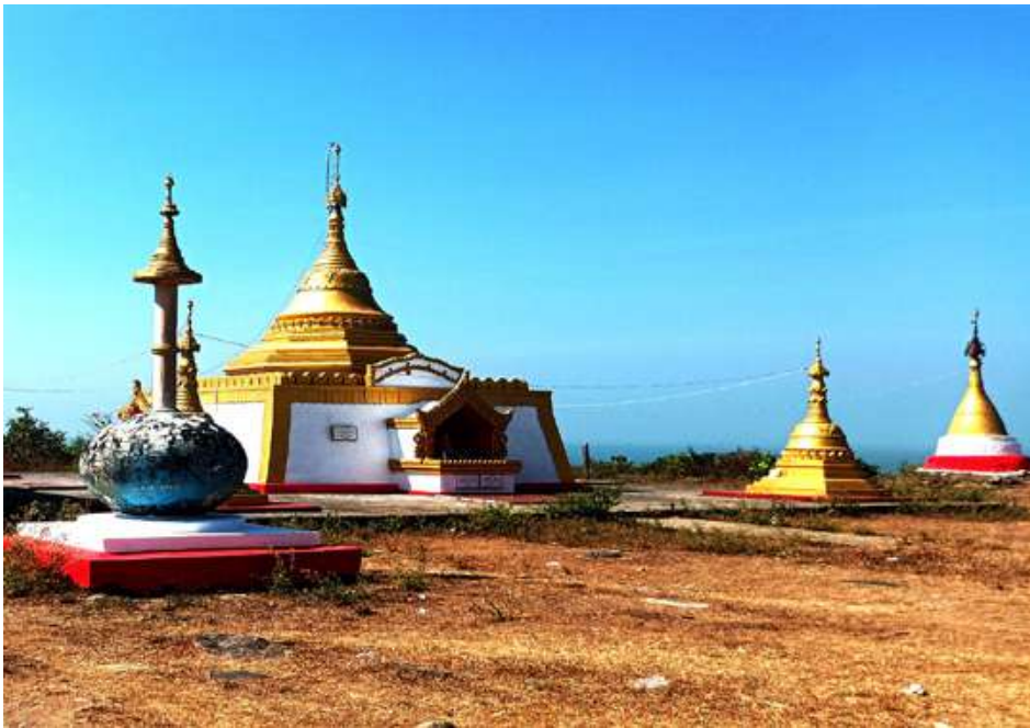
ရှင်စောပုစေတီတော်ကို ဖူးတွေ့ရစဉ်။

စေတီတော်အောက်ခြေမှာရှိတဲ့ ပင်လယ်ကမ်းစပ်ကို ရောက်တဲ့အခါမှာ မိမိတို့မောင်နှမတွေနဲ့ အခြားလူလေး၊ ငါးယောက်လောက်သာ ရှိနေကြတယ်။ ဒီနေရာပင်လယ်ကမ်းခြေမှာ ကျောက်ဆောင်၊ ကျောက်ကမ်းပါးတွေရှိမနေကြဘဲ ချောင်းသာကမ်းခြေမှာလို၊ ငွေဆောင်ကမ်းခြေမှာလို သဲသောင်ပြင်ကြီးတွေ တစ်မျှော်တစ်ခေါ် ကျယ်ကျယ်ပြန့်ပြန့်ရှိနေကြပေမဲ့ ပင်လယ်ရေထဲမှာ ရေချိုး၊ ရေဆော့နေကြသူရှိမနေကြပါဘူး။ ဒါကြောင့် ပင်လယ်ကမ်းခြေတစ်လျှောက်မှာ ခြောက်ခြောက်ကပ်ကပ်၊ တိတ်တိတ်