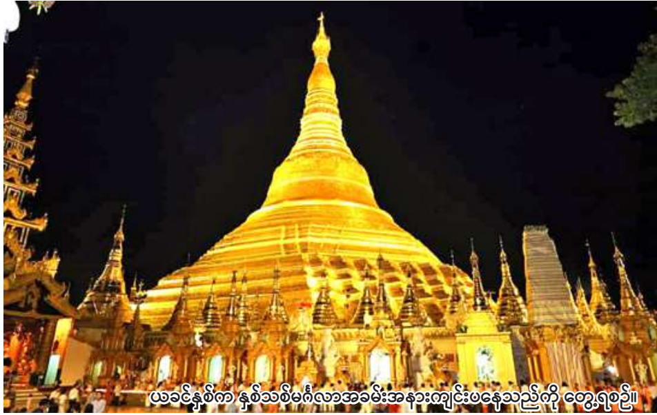
လခင်နှစ်က နှစ်သစ်မင်္ဂလာအခမ်းအနားကျင်းပနေသည့်ကို တွေ့ရစဉ်။

ရန်ကုန် ဧပြီ ၉ ရန်ကုန်တိုင်းဒေသကြီး ဒဂုံမြို့နယ်ရှိ ရွှေတိဂုံစေတီတော်တွင် ၁၃၈၈ ခုနှစ် နှစ်သစ်မင်္ဂလာအခမ်းအနားကို မြန်မာနှစ်ဆန်းတစ်ရက်နေ့တွင် အစဉ်အလာမပျက် စည်ကားသိုက်မြိုက်စွာ ကျင်းပမည်