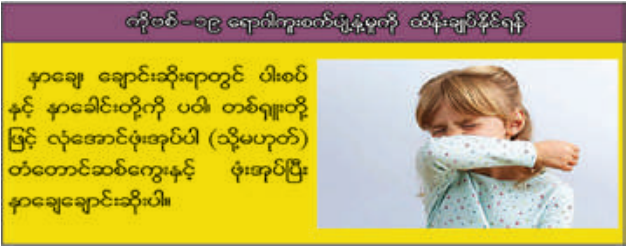
ကိုဗစ်-၁၉ ရောဂါကူးစက်မှုနှုန်းကို ထိန်းချုပ်နိုင်ရန် မှာချေး ချောင်းဆိုးရာတွင် ပါးစပ် နှင့် နှာခေါင်းတို့ကို ပါးစပ် တစ်ဖက်တို့ ဖြင့် လှုံ့အောင်ဖုံးအုပ်ပါ (သို့မဟုတ်) တံတောင်ဆစ်ကျေးနှင့် ဖုံးအုပ်ပြီး မှာချေးချောင်းဆိုးပါ။