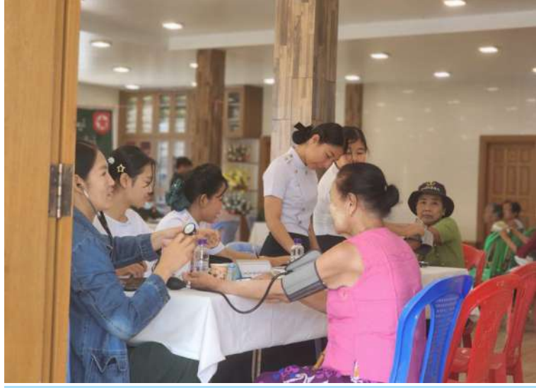
ရန်ကုန်တိုင်းစစ်ဌာနချုပ် နယ်လှည့်ဆေးကုသရေးအဖွဲ့က ဒေသခံပြည်သူများကို ကျန်းမာရေးစောင့်ရှောက်မှုလုပ်ငန်းများ ဆောင်ရွက်ပေးစဉ်။

နေပြည်တော် ဖေဖော်ဝါရီ ၂၁ ရက်နေ့၊ မှော်ဘီမြို့နယ် နယ်လှည့်ဆေးကုသရေးအဖွဲ့က ဒေသခံပြည်သူများကို ကျန်းမာရေးစောင့်ရှောက်မှုလုပ်ငန်းများ ဆောင်ရွက်ပေးစဉ်။ ကျန်းမာရေးကဏ္ဍ တိုးတက်မြှင့်တင်ရေးအတွက် ကျန်းမာရေးစောင့်ရှောက်မှုလုပ်ငန်းများတွင် တစ်ဖက်တစ်လမ်းက ကူညီစောင့်ရှောက်မှုများ ဆောင်ရွက်ပေးလျက်ရှိရာ ယနေ့နံနက်ပိုင်းတွင် ရန်ကုန်တိုင်းစစ်ဌာနချုပ် နယ်လှည့်ဆေးကုသရေးအဖွဲ့က မှော်ဘီမြို့နယ် နယ်လှည့်ဆေးကုသရေးအဖွဲ့နှင့် ပူးပေါင်းဆောင်ရွက်ခဲ့သည်။