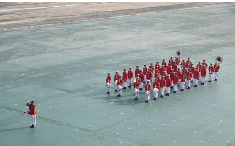
၃၂ ကြိမ်မြောက် တပ်မတော် (ကြည်း၊ ရေ၊ လေ) စစ်တီးဝိုင်းပြိုင်ပွဲတွင် တောင်ပိုင်းတိုင်း စစ်ဌာနချုပ် ကိုယ်စားပြု အမှတ်(၁) စစ်တီးဝိုင်းအသင်း ယှဉ်ပြိုင်စဉ်။