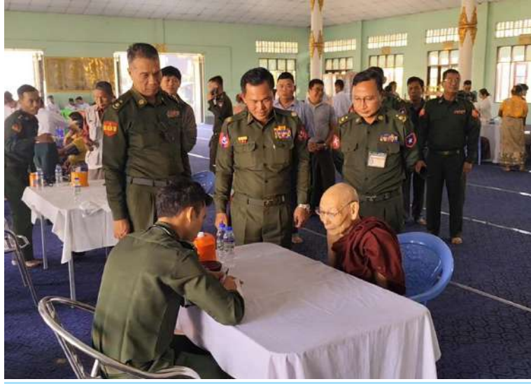
သံဃာတော်များအား ကျန်းမာရေးစောင့်ရှောက်မှုလုပ်ငန်းများ ဆောင်ရွက်ပေးနေမှုကို အလယ်ပိုင်းတိုင်းစစ်ဌာနချုပ်မှ တာဝန်ရှိသူများက ကြည့်ရှုအားပေးစဉ်။

နေပြည်တော် ဖေဖော်ဝါရီ ၂၁ ရက်နေ့၊ မှော်ဘီမြို့နယ် နယ်လှည့်ဆေးကုသရေးအဖွဲ့က ဒေသခံပြည်သူများကို ကျန်းမာရေးစောင့်ရှောက်မှုလုပ်ငန်းများ ဆောင်ရွက်ပေးစဉ်။ ကျန်းမာရေးကဏ္ဍ တိုးတက်မြှင့်တင်ရေးအတွက် ကျန်းမာရေးစောင့်ရှောက်မှုလုပ်ငန်းများတွင် တစ်ဖက်တစ်လမ်းက ကူညီစောင့်ရှောက်မှုများ ဆောင်ရွက်ပေးလျက်ရှိရာ ယနေ့နံနက်ပိုင်းတွင် ရန်ကုန်တိုင်းစစ်ဌာနချုပ် နယ်လှည့်ဆေးကုသရေးအဖွဲ့က မှော်ဘီမြို့နယ် နယ်လှည့်ဆေးကုသရေးအဖွဲ့နှင့် ပူးပေါင်းဆောင်ရွက်ခဲ့သည်။