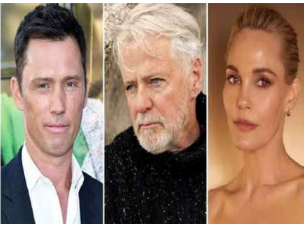
Ref : Russia Today Trs : KKO

နယူးယောက် ဖေဖော်ဝါရီ ၂၁ အမျိုးသမီးတစ်ဦးတို့ကြား မေတ္တာဇာတ်လမ်းကို ဇာတ်အိမ်ဖွဲ့ရိုက်ကူးမည့် ဇာတ်ကားဖြစ်သည်။ အဆိုပါဇာတ်ကားကို ဒါရိုက်တာ မာ့ရီလီယံက တာဝန်ယူရိုက်ကူးမည်ဖြစ်ပြီး ဝတ္ထုဇာတ်ညွှန်းကို ဇာတ်ညွှန်းရေးဆရာ မာ့အက်ဝင် ရော်ဘင်ဆန်က တာဝန်ယူရေးသားပေးထားကြောင်း သိရသည်။ လက်ရှိတွင် Hal ဇာတ်ကား ရိုက်ကူးထုတ်လုပ်မှုကို အတ္တလန္တာ သရုပ်ဆောင်ရမည် ဖြစ်ကြောင်း မြို့တော်၌ စတင်နေပြီဖြစ်ကြောင်း သိရသည်။ Hal ဇာတ်ကားသည် သတင်းစာဆရာတစ်ဦးနှင့် ဂီတပညာရှင်