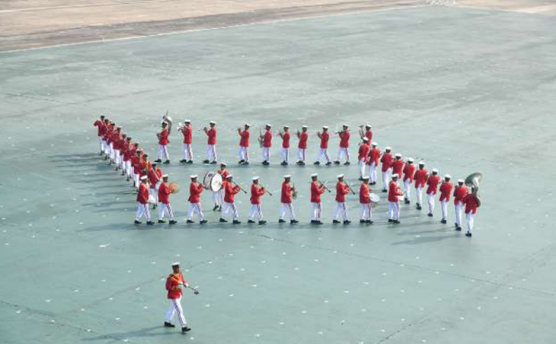
၃၂ ကြိမ်မြောက် တပ်မတော် (ကြည်း၊ ရေ၊ လေ) စစ်တီးဝိုင်းပြိုင်ပွဲတွင် မြောက်ပိုင်းတိုင်း စစ်ဌာနချုပ် ကိုယ်စားပြု စစ်တီးဝိုင်းအသင်း ယှဉ်ပြိုင်စဉ်။

ဘူတာသစ်တည်ဆောက်မည့် မြေနေရာ၊ ကျောက်ဆည်ဘူတာနှင့် မင်းစုဘူတာကြားရှိ တံတားအမှတ်(၇၇၂) တည်ဆောက်နေမှုကို ကြည့်ရှုစစ်ဆေးပြီး စံချိန်စံညွှန်းနှင့်အညီ ထို့နောက် ကျောက်ဆည်ဘူတာသို့ ရောက်ရှိပြီး အသစ်ပြန်လည်တည်ဆောက်မည့် အလျားပေ ၁၀၀၊ အနံပေ ၄၀ ကွန်ကရစ် ကြမ်းခင်း သံကူကွန်ကရစ်အမျိုးအစား သတ်မှတ်ကာလအမီပြီးစီးရေး၊ လုပ်ငန်းခွင် အန္တရာယ်ကင်းရှင်းရေး မှာကြားသည်။ ယင်းနောက် ပြည်ထောင်စုဝန်ကြီးနှင့် အဖွဲ့သည် RBEရထားဖြင့် ဆက်လက်ထွက်ခွာ လာရာ သပြေတောင်းဘူတာသို့ရောက်ရှိပြီး ဘူတာအသစ်တည်ဆောက်နေမှုကို ကြည့်ရှုစစ်ဆေးကာ ဘူတာအဝင်အထွက်လမ်းများ စနစ်တကျဆောင်ရွက်ရေး မှာကြားသည်။