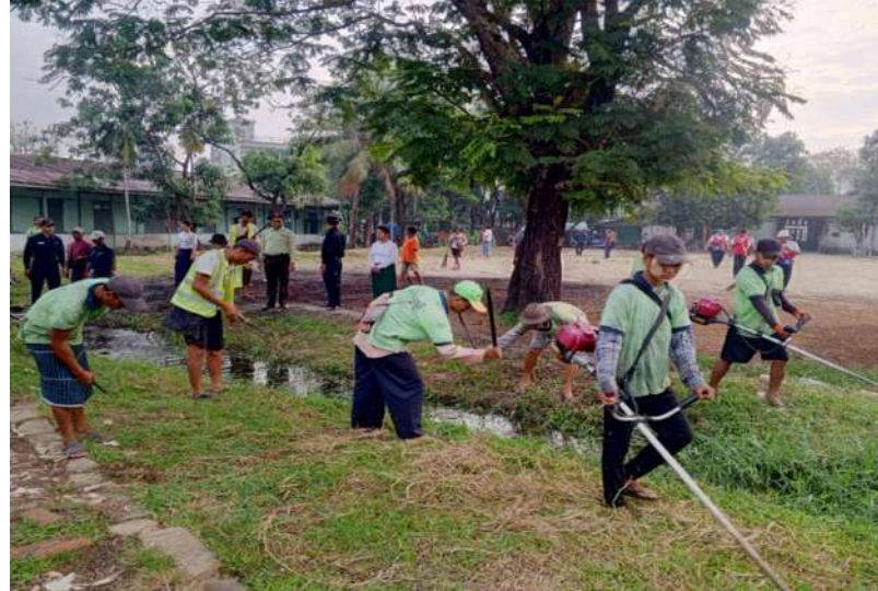
ရန်ကုန်တိုင်းဒေသကြီးရှိ အခြေခံပညာကျောင်းများ၌ ဌာနဆိုင်ရာများ၊ လူမှုရေးအသင်းအဖွဲ့များ စုပေါင်းသန့်ရှင်းရေးဆောင်ရွက်ကြစဉ်။

နေပြည်တော် ဖေဖော်ဝါရီ ၂၁ ၂၀၂၅-၂၀၂၆ ပညာသင်နှစ်တွင် ကျောင်းသား၊ ကျောင်းသူများ အဆင်ပြေချောမွေ့စွာ ပညာသင်ကြားနိုင်ရေးနှင့် စာသင်ကျောင်းများ ဥပမာရုပ်ကောင်းမွန်စေရေးအတွက် တိုင်းဒေသကြီးနှင့် ပြည်နယ်အသီးသီးရှိ အခြေခံပညာကျောင်းများ၌ ကျောင်းပတ်ဝန်းကျင်သန့်ရှင်းသာယာလှပရေးအတွက် နယ်မြေခံတပ်မတော်သားများ၊ ဌာနဆိုင်ရာဝန်ထမ်းများ၊ လူမှုရေးအသင်းအဖွဲ့များနှင့် ဒေသခံပြည်သူများက စုပေါင်းသန့်ရှင်းရေးလုပ်ငန်းများ ဆောင်ရွက်လျက်ရှိသည်။ ထိုသို့ ဆောင်ရွက်ပေးလျက်ရှိရာ ယနေ့တွင် ရန်ကုန်တိုင်းဒေသကြီး သာကေတမြို့နယ်အပါအဝင် မြို့နယ် ၁၀ မြို့နယ်တို့၌