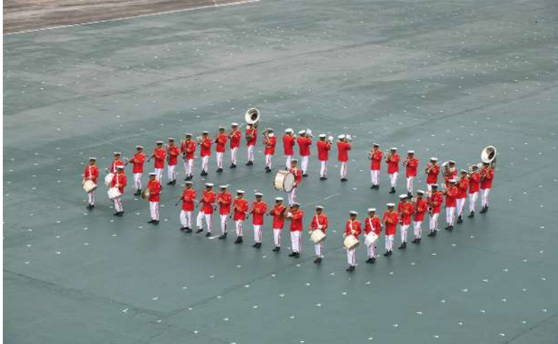
၃၂ ကြိမ်မြောက် တပ်မတော် (ကြည်း၊ ရေ၊ လေ) စစ်တီးဝိုင်းပြိုင်ပွဲတွင် တြိဂံဒေသတိုင်း စစ်ဌာနချုပ် ကိုယ်စားပြု အမှတ်(၂) စစ်တီးဝိုင်းအသင်း ယှဉ်ပြိုင်စဉ်။