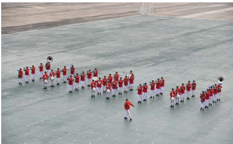
၃၂ ကြိမ်မြောက် တပ်မတော် (ကြည်း၊ ရေ၊ လေ) စစ်တီးဝိုင်းပြိုင်ပွဲတွင် ကမ်းရိုးတန်းဒေသ တိုင်းစစ်ဌာနချုပ် ကိုယ်စားပြုအမှတ်(၁) စစ်တီးဝိုင်းအသင်း ယှဉ်ပြိုင်စဉ်။

★ ကျော့ဖုံးမှအဆက် ကမ်းရိုးတန်းဒေသတိုင်းစစ်ဌာနချုပ် ကိုယ်စားပြုအမှတ်(၁)စစ်တီးဝိုင်းအသင်းနှင့် အရှေ့တောင်တိုင်းစစ်ဌာနချုပ် ကိုယ်စားပြုအမှတ်(၂)စစ်တီးဝိုင်းအသင်းတို့ ယှဉ်ပြိုင်ခဲ့ကြသည်။