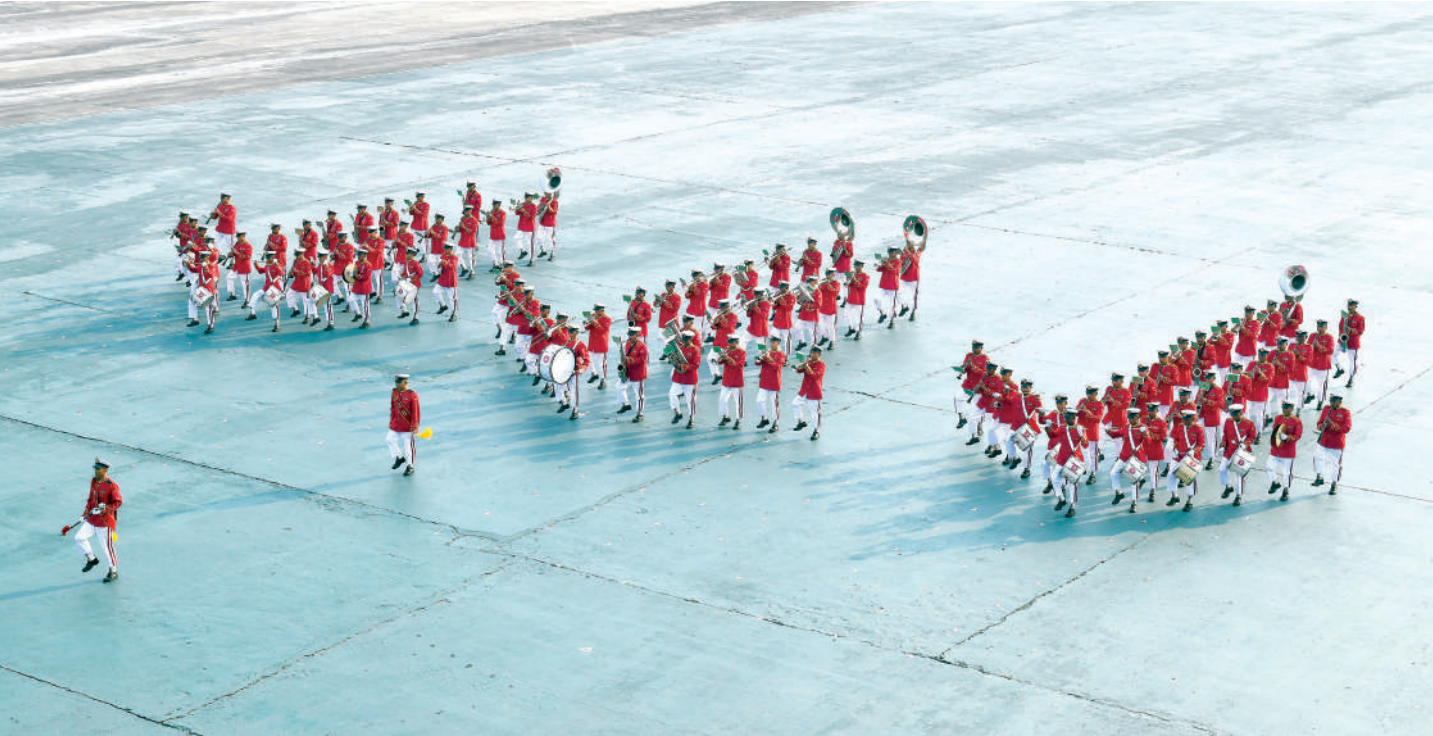
၃၂ ကြိမ်မြောက် တပ်မတော်(ကြည်း၊ ရေ၊ လေ) စစ်တီးဝိုင်းပြိုင်ပွဲ စတုတ္ထနေ့တွင် စစ်တက္ကသိုလ်ကိုယ်စားပြု စစ်တီးဝိုင်းအသင်း ယှဉ်ပြိုင်စဉ်။

နေပြည်တော် ဖေဖော်ဝါရီ ၂၁ ၂၀၂၆ ခုနှစ် စာ နှစ်မြောက် တပ်မတော်နေ့အထိမ်းအမှတ် ၃၂ ကြိမ်မြောက် တပ်မတော်(ကြည်း၊ ရေ၊ လေ) စစ်တီးဝိုင်းပြိုင်ပွဲ(က)အဆင့်နှင့်(ခ)အဆင့်ပြိုင်ပွဲများကို ယနေ့နံနက်ပိုင်းနှင့် မွန်းလွဲပိုင်းတို့တွင် နေပြည်တော်ရှိ စစ်ကြောရေးနှင့် တည်းခိုရေးစခန်း စစ်ရေးပြကွင်း၌ ဆက်လက်ကျင်းပသည်။ ပြိုင်ပွဲတွင် စစ်တက္ကသိုလ်ကိုယ်စားပြု စစ်တီးဝိုင်းအသင်း၊ တောင်ပိုင်းတိုင်းစစ်ဌာနချုပ် ကိုယ်စားပြု အမှတ်(၁)စစ်တီးဝိုင်းအသင်း၊ မြောက်ပိုင်းတိုင်း စစ်ဌာနချုပ်ကိုယ်စားပြု စစ်တီးဝိုင်းအသင်း၊ နေပြည်တော်တိုင်းစစ်ဌာနချုပ်ကိုယ်စားပြု အမှတ်(၂) စစ်တီးဝိုင်းအသင်း၊ ကြိမ်ဒေသတိုင်းစစ်ဌာနချုပ်ကိုယ်စားပြု အမှတ်(၂)စစ်တီးဝိုင်းအသင်း၊ စာမျက်နှာ ၁၇ ကော်လံ ၁ ☆