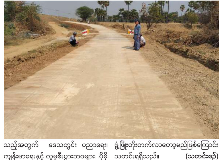
သည့်အတွက် ဒေသတွင်း ပညာရေး၊ ဖွံ့ဖြိုးတိုးတက်လာတော့မည်ဖြစ်ကြောင်း ကျန်းမာရေးနှင့် လူမှုစီးပွားဘဝများ ပိုမို သတင်းရရှိသည်။ (သတင်းစဉ်)

နေပြည်တော် ဖေဖော်ဝါရီ ၂၁ - နယ်စပ်ရေးရာဝန်ကြီးဌာနအနေဖြင့် ဒေသဖွံ့ဖြိုးရေးလုပ်ငန်းများကို တစ်နိုင်ငံလုံး အကြားအလပ်မရှိ ဆောင်ရွက်ပေးလျက် ရှိရာ ၂၀၂၅-၂၀၂၆ ဘဏ္ဍာနှစ် နယ်စပ် ဒေသဖွံ့ဖြိုးရေး ပြည်ထောင်စုရန်ပုံငွေဖြင့် ဆောင်ရွက်ခဲ့သည့် မန္တလေးတိုင်းဒေသ ကြီး မိတ္ထီလာခရိုင် မိတ္ထီလာမြို့နယ် သီးပင်ကုန်းကျေးရွာမှ အောင်သုခမေ့ ရိပ်သာသို့ဆက်သွယ်ထားသည့် မြေသား လမ်းတစ်မိုင်သုံးဖာလုံအနက်လေးဖာလုံကို ၁၂ ပေအကျယ်ကွန်ကရစ်ခင်းခြင်း၊ အဆိုပါ လမ်းပေါ်တွင် ၅' x ၅' x ၂၆' Box Culvert နှစ်စင်းတည်ဆောက်ခြင်း၊ အောင်သုခ မေ့ရိပ်သာကျောင်းဝင်းအတွင်း မော်တော် ဆိုင်ကယ်သွားမြေသားလမ်းတစ်ဖာလုံကို ၁၀ ပေအကျယ် ကွန်ကရစ်ခင်းခြင်း လုပ်ငန်းများ ယခုအခါရာနှုန်းပြည့်ဆောင် ရွက်ပြီးစီးပြီဖြစ်ကြောင်း သိရသည်။ နယ်စပ်ရေးရာဝန်ကြီးဌာန နယ်စပ် ဒေသနှင့် တိုင်းရင်းသားလူမျိုးများဖွံ့ဖြိုး တိုးတက်ရေးဦးစီးဌာန မိတ္ထီလာခရိုင် ဖွံ့ဖြိုးမှုကြီးကြပ်ရေးရုံး၏ ကြီးကြပ်မှုဖြင့် အဆိုပါလုပ်ငန်းများ ဆောင်ရွက်ပေးနိုင်ခဲ့ မှုကြောင့် မိတ္ထီလာမြို့နယ်အတွင်းရှိ ကျေးရွာအုပ်စုသုံးစုမှ ကျေးရွာ ၁၀ ရွာရှိ ဒေသခံပြည်သူများအနေဖြင့် ဒေသ ထွက်ကုန်သီးနှံများ ရောင်းဝယ်ဖောက် ကားသယ်ယူပို့ဆောင်ရာ၌ ယခင်ကထက် ပိုမိုလွယ်ကူချောမွေ့ အဆင်ပြေလာပြီဖြစ်