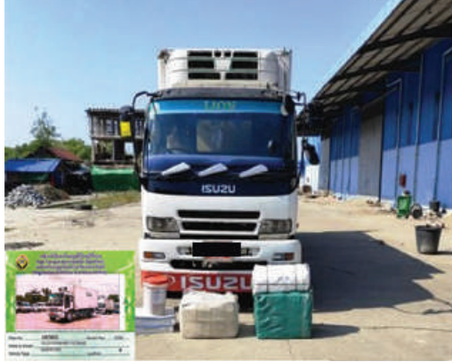
မွန်ပြည်နယ်၌ ဖမ်းဆီးရမိမှု

လူဝင်မှုကြီးကြပ်ရေးနှင့် ပြည်သူ့အင်အားဝန်ကြီးဌာန