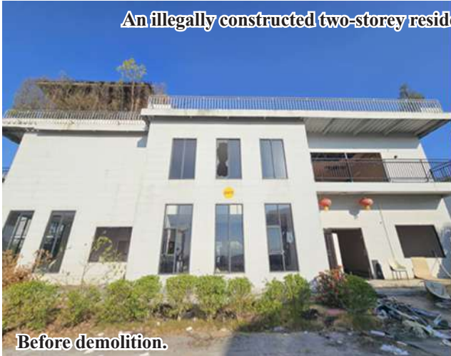
An illegally constructed two-storey residential building in KK Park Area (Section 3)