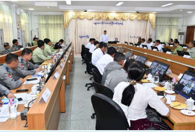
မန္တလေးတိုင်းဒေသကြီးအတွင်း ပါတီစုံဒီမိုကရေစီအထွေထွေရွေးကောက်ပွဲ အပိုင်း(၂) အောင်မြင်စွာကျင်းပနိုင်ရေး လုပ်ငန်းညှိနှိုင်းအစည်းအဝေး ကျင်းပစဉ်။

သူများ၊ တိုင်းဒေသကြီးအဆင့်ဌာနဆိုင်ရာ များ၊ တိုင်းဒေသကြီး၊ ခရိုင်အဆင့် ရဲတပ်ဖွဲ့ ဝင်များ တက်ရောက်ကြပြီး ခရိုင်၊ မြို့နယ် အဆင့် ဌာနဆိုင်ရာများက Virtual စနစ် ဖြင့် တက်ရောက်ကြသည်။ ဦးစွာ တိုင်းဒေသကြီးဝန်ကြီးချုပ်က အဖွင့်အမှာစကားပြောကြားပြီး တိုင်းမှူး က လုံခြုံရေးဆိုင်ရာကိစ္စရပ်များနှင့် ပတ်သက်၍ အမှာစကားပြောကြားသည်။ ထို့နောက် တာဝန်ရှိသူများက ပါတီစုံ ဒီမိုကရေစီ အထွေထွေရွေးကောက်ပွဲ အပိုင်း(၁) ကျင်းပခဲ့သည့် မြို့နယ် ကိုး မြို့နယ်မှ အားနည်းချက်၊ အားသာချက် များကိုလည်းကောင်း၊ ဆက်လက်ကျင်းပ မည့် ရွေးကောက်ပွဲအတွက် လုပ်ငန်းများ ဆောင်ရွက်ထားရှိမှု အခြေအနေများကို လည်းကောင်း Powerpoint ဖြင့် ရှင်းလင်း တင်ပြကြရာ တိုင်းဒေသကြီးဝန်ကြီးချုပ် နှင့် တိုင်းမှူးတို့က ဆွေးနွေးတင်ပြချက် များအပေါ် လိုအပ်သည်များ ပေါင်းစပ် ညှိနှိုင်းဆောင်ရွက်ပေးခဲ့ကြောင်း သတင်း ရရှိသည်။ (၅၀၁)