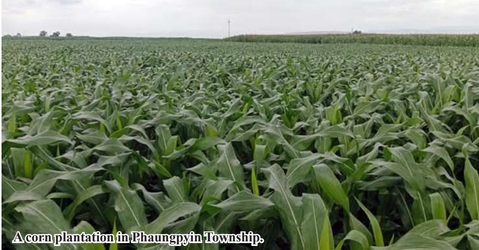
A corn plantation in Phaungpyin Township.