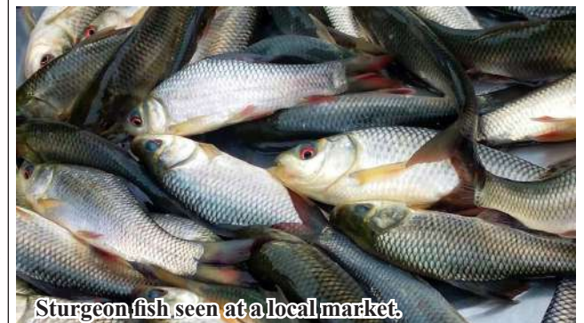
Sturgeon fish seen at a local market.