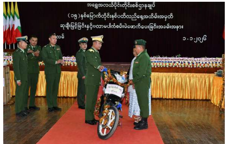
အရှေ့အလယ်ပိုင်းတိုင်းစစ်ဌာနချုပ် တိုင်းမှူး ဗိုလ်ချုပ်စိုးမြတ်ထွဋ် တိုင်းနှစ်ပတ် လည်နေ့အထိမ်းအမှတ်အဖြစ် အရာရှိ၊ စစ်သည်၊ မိသားစုဝင်များကို ဗလာမပါကံစမ်းမဲ များ ဖောက်ပေးစဉ်။

မွေးမြူရေးဆုရရှိသူများကို တိုင်းမှူးနှင့် တာဝန်ရှိသူများက ဂုဏ်ပြုဆုများ အသီးသီး ပေးအပ်ချီးမြှင့်ကြပြီး တိုင်းနှစ်ပတ်လည် နေ့အထိမ်းအမှတ်အဖြစ် အရာရှိ၊ စစ်သည်၊ မိသားစုဝင်များကို ဗလာမပါကံစမ်းမဲများ ဖောက်ပေးခဲ့ကြသည်။ ၎င်းနောက် ညပိုင်း တွင် တိုင်းစစ်ဌာနချုပ် အားကစားကွင်း၌ တိုင်းနှစ်ပတ်လည်နေ့ အထိမ်းအမှတ် နိဗ္ဗာန်ဈေးပွဲတော်နှင့် ဂုဏ်ပြုညစာစားပွဲ ဆက်လက်ကျင်းပရာ ပြည်သူ့ဆက်ဆံ ရေးနှင့် စိတ်ဓာတ်စစ်ဆင်ရေးညွှန်ကြား ရေးမှူးရုံး ကွပ်ကဲမှုအောက် နယ်လှည့် ပြည်သူ့ဆက်ဆံရေးတပ်ခွဲက တေးသီချင်း များ၊ အကအလှပဒေသာများဖြင့် ဖျော်ဖြေခဲ့ ကြကြောင်း သတင်းရရှိသည်။ (၅၀၁)