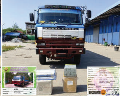
စစ်ကိုင်းတိုင်းဒေသကြီး၌ ဖမ်းဆီးရမိမှု