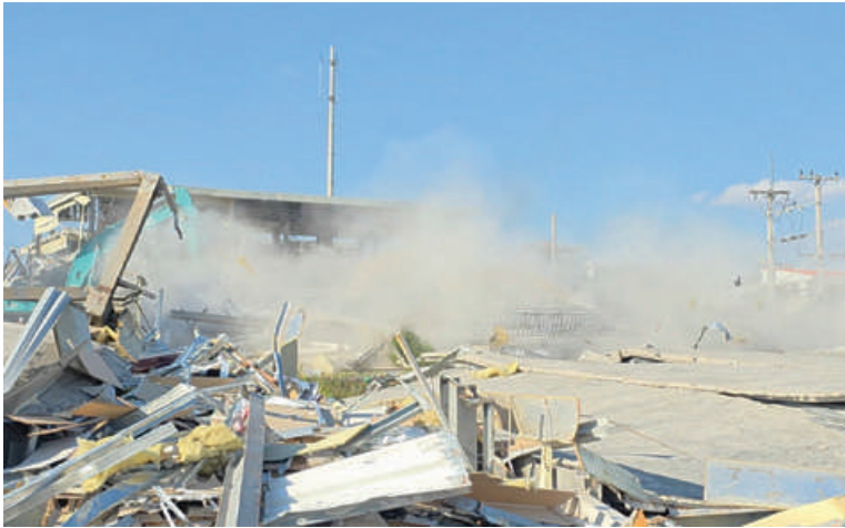
KK Park နယ်မြေ အပိုင်း(၃)တွင် တရားမဝင်အဆောက်အအုံလုပ်ထားသည့် နှစ်ထပ် လူနေအဆောက်အအုံများကို လေအိုးမီးအိုးဖြင့် မဖြိုဖျက်မီနှင့် ဖြိုဖျက်ပြီးစီးမှု မှတ်တမ်းဓာတ်ပုံ။

ဖြစ်ကြောင်း သိရသည်။ ၎င်းအပြင် KK park နယ်မြေအတွင်းရှိ အွန်လိုင်းလိမ်လည် လောင်းကစားမှု ကျူးလွန်ရာတွင် အသုံးပြုခဲ့သည့်ပစ္စည်းများကို ထပ်မံအသုံးပြုမှုမရှိစေရေးအတွက် ယနေ့တွင်လည်း စနစ်တကျမီးရှို့ဖျက်ဆီးခဲ့ကြောင်းနှင့် နိုင်ငံတော်အစိုးရအနေဖြင့် အွန်လိုင်းလိမ်လည်လောင်းကစားမှုကျူးလွန်မှုများကို အမျိုးသားရေးတာဝန်တစ်ရပ်အဖြစ်ခံယူကာ မြန်မာနိုင်ငံအတွင်း လုံးဝအခြေမပြုနိုင်ရေး ပြည်တွင်းအင်အားစုများအပြင် အိမ်နီးချင်းနိုင်ငံအစိုးရများနှင့်လည်း ပေါင်းစပ်ညှိနှိုင်း၍ ဆက်လက် ဆောင်ရွက်သွားမည်ဖြစ်ကြောင်း သတင်းရရှိသည်။