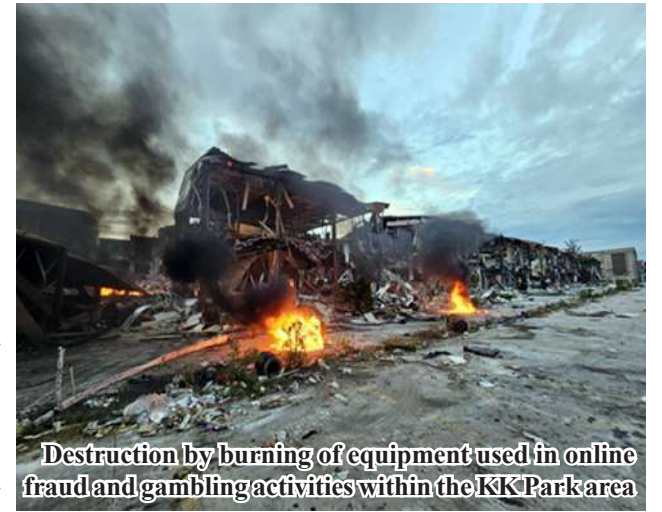
Destruction by burning of equipment used in online fraud and gambling activities within the KK Park area