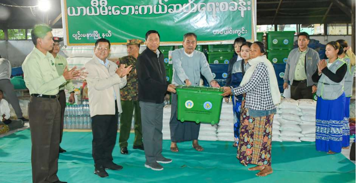
နှင့်အတူ ဝိုင်းဝန်းလုပ်ဆောင်နေထိုင်နိုင်ရေး ရာ ရန်အောင်(၂)ရပ်ကွက် ရန်နိုင်ရပ်နယ်မြေ လိုအပ်သည်များ ပေါင်းစပ်ညှိနှိုင်းဆောင်ရွက် တို့ကိုအားပေးမှာကြားကာ မီးလောင်မှုဖြစ်ပွား (၁၆) မီးလောင်ပြင်သို့သွားရောက်ကြည့်ရှုပြီး ပေးခဲ့ကြောင်း သတင်းရရှိသည်။(သတင်းစဉ်)

များ၊ ရေသန့်နှင့်ခေါက်ဆွဲခြောက်ထုပ်များ၊ စုစုပေါင်းငွေကျပ် ၂၅၇ သိန်းခန့် တန်ဖိုးရှိ ငွေ နှင့်ပစ္စည်းများကို အိမ်ထောင်စုအလိုက်၊ လူဦးရေအလိုက် ထောက်ပံ့ပေးအပ်သည်။ ယင်းနောက် ပြည်ထောင်စုဝန်ကြီးက ဆောင်းရာသီကာလ အေးချမ်းသောရာသီ ဖြစ်၍ ဝန်ကြီးဌာနနှင့် နေပြည်တော်ကောင်စီ တို့အနေဖြင့် မီးဘေးသင့်ပြည်သူများ နွေးထွေးစွာအိပ်စက်နိုင်ရေးအတွက် မြေယာ ခင်းများ၊ စောင်များအစရှိသည့်အိပ်ရာပစ္စည်း များကို ချက်ချင်းစီစဉ်ပေးခဲ့ပါကြောင်း၊ ယခု လည်းစခန်း၌ နေထိုင်စဉ်ကာလ နေ့စဉ်စား သောက်ရေးကို ဒေသအုပ်ချုပ်ရေးအဖွဲ့များ၊ တာဝန်ရှိသူများက စနစ်တကျစီစဉ်ပေးလျက် ရှိပါကြောင်း၊ မီးဘေးသင့်ပြည်သူများအနေ ဖြင့်လည်း နေထိုင်စားသောက်ရေး၊ သန့်ရှင်း သော အစားအစာနှင့် သောက်သုံးရေစနစ် တကျသုံးစွဲရေးတို့အတွက် တာဝန်ရှိသူများ