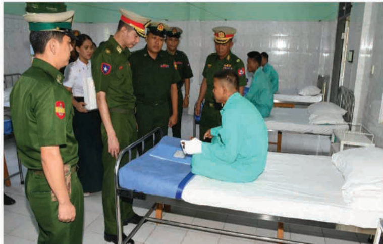
အလယ်ပိုင်းတိုင်းစစ်ဌာနချုပ် တိုင်းမှူး ဗိုလ်မှူးချုပ်အောင်ဌေး ဆေးကုသမှုခံယူနေသူများကို ရင်းရင်းနှီးနှီးမေးမြန်းအားပေးစကားပြောကြားစဉ်။

ဝင်များနှင့် ဒေသခံတိုင်းရင်းသားပြည်သူများကို တိုင်းစစ်ဌာနချုပ်များမှ တိုင်းမှူးများနှင့် တာဝန်ရှိသူများကသွားရောက် ကြည့်ရှု၍ တစ်ဦးချင်း၏ ရောဂါဖြစ်ပွားမှု၊ ဆေးဝါးကုသပေးထားမှုနှင့် ကျန်းမာရေး တိုးတက်ကောင်းမွန်မှု အခြေအနေများကို ရင်းရင်းနှီးနှီးမေးမြန်းအားပေးစကားပြောကြားပြီး အာဟာရဖြည့်စားသောက်ဖွယ်ရာများနှင့် ချီးမြှင့်ငွေများပေးအပ်ကြသည်။ ထို့နောက် တိုင်းစစ်ဌာနချုပ်များမှ တိုင်းမှူးများနှင့် တာဝန်ရှိသူများသည် ဆေးရုံများအတွင်း လှည့်လည်ကြည့်ရှု စစ်ဆေးကြပြီး လိုအပ်သည်များပေါင်းစပ်ညှိနှိုင်း ဆောင်ရွက်ပေးခဲ့ကြကြောင်း သတင်းရရှိသည်။ (၅၀၁)