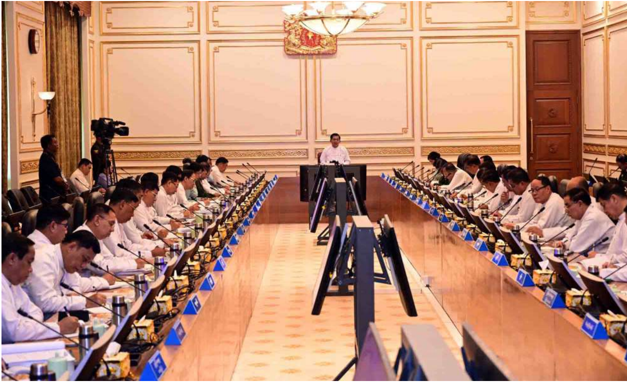
President U Min Aung Hlaing delivers an address at the meeting of the Central Committee for Implementation of Progress of Border Areas and National Races.