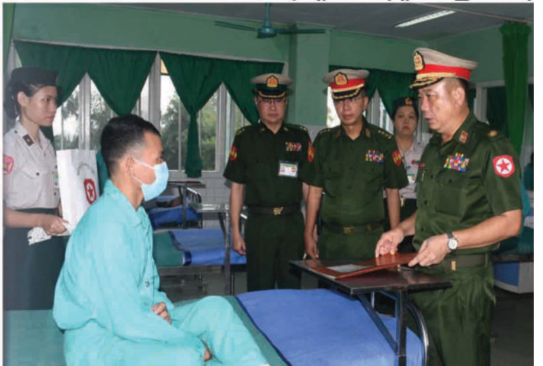
ရန်ကုန်တိုင်းစစ်ဌာနချုပ် တိုင်းမှူး ဗိုလ်မှူးချုပ်တင်မင်းလတ် ဆေးကုသမှုခံယူနေသူတစ်ဦးကို ရင်းရင်းနှီးနှီးမေးမြန်းအားပေးစကားပြောကြားစဉ်။