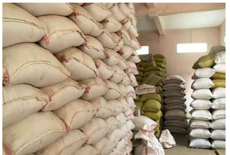
Bags of broken rice stored in a warehouse.