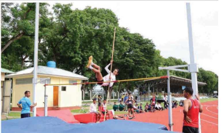
ကာကွယ်ရေးဦးစီးချုပ်(လေ) တံခွန်စိုက်ခိုင်း ပြေးခုန်ပစ်ပြိုင်ပွဲ ဗိုလ်လုပွဲယှဉ်ပြိုင်ကစားနေမှုကို တွေ့ရစဉ်။

(လေ)ကိုယ်စား နယ်မြေခံလေတပ်စခန်းဌာနချုပ်မှူးကလည်းကောင်း ခိုင်းဆုနှင့် ဂုဏ်ပြုဆုများ အသီးသီးချီးမြှင့်ပေးအပ်သည်။ အဆိုပါ ပြေးခုန်ပစ်ပြိုင်ပွဲကို ပြိုင်ပွဲဝင် အမျိုးသားအသင်း ၁၄ သင်း၊ အမျိုးသမီးအသင်း ၁၃ သင်းတို့ဖြင့် ဇွန် ၂၂ ရက်မှ ယနေ့ထိ ယှဉ်ပြိုင်ကစားခဲ့ခြင်းဖြစ်ကြောင်း သတင်းရရှိသည်။ (၅၀၁)