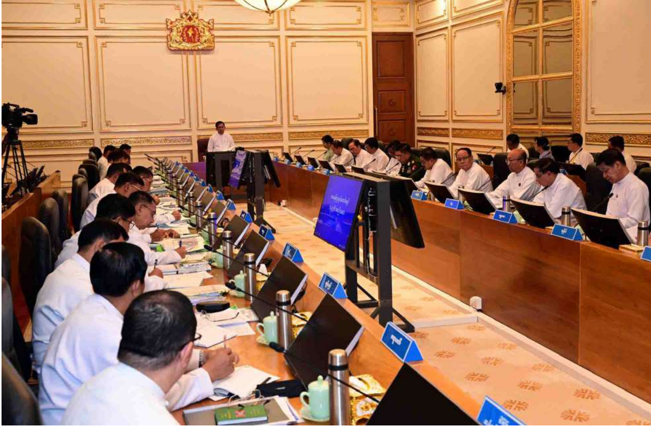
President U Min Aung Hlaing delivers an address at the Food Policy Commission meeting.