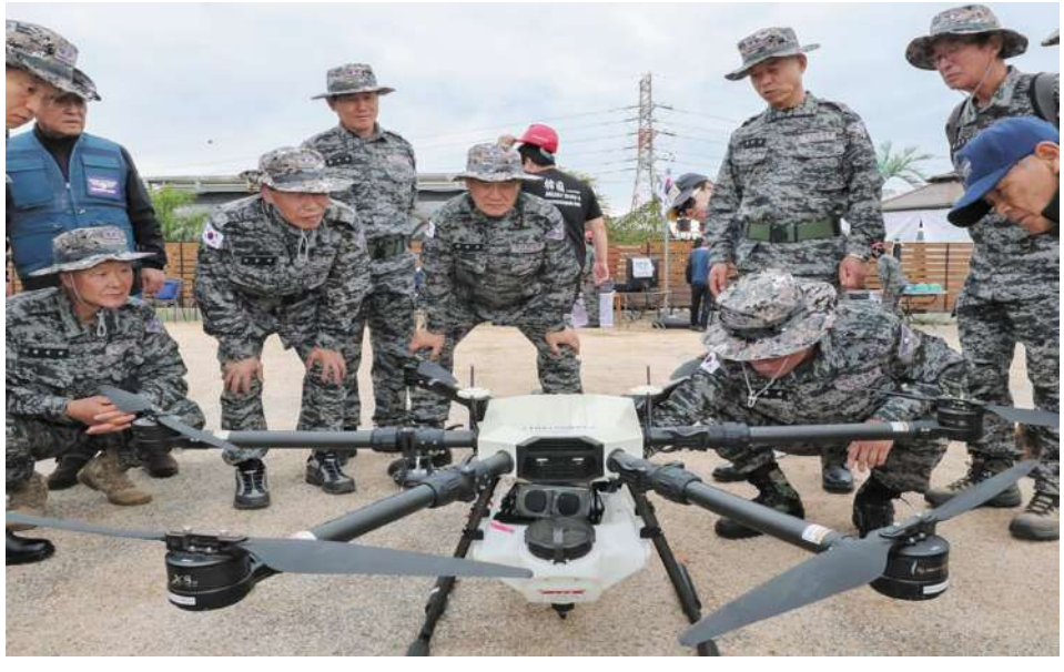
Ref : Xinhua Trs : KKO

ယူကရိန်းပဋိပက္ခနှင့် အရှေ့အလယ်ပိုင်း စစ်ရေးပဋိပက္ခများတွင် မောင်းသူမဲ့ဒရုန်းယာဉ်များ အနေဖြင့် စစ်မြေပြင်အခြေအနေပြောင်းလဲနိုင်စွမ်းကို သက်သေပြနေကြောင်း တောင်ကိုရီးယားက ကာကွယ်ရေးဝန်ကြီး အန်းဂျာကမ်က သုံးသပ်ပြောကြားထားသည်။ တောင်နှင့်မြောက် ကိုရီးယား နှစ်နိုင်ငံတို့သည် ၁၉၅၀- ၁၉၅၃ ခုနှစ် ကိုရီးယားကျွန်းဆွယ်ပဋိပက္ခကို အပစ်အခတ်ရပ်စဲရေးသဘောတူညီချက်ဖြင့် ရပ်ဆိုင်းထားရာ လက်တွေ့အားဖြင့် ပဋိပက္ခဖြစ်နေဆဲ အခြေအနေတွင်သာ ရှိသေးသည်။ မြောက်ကိုရီးယား နိုင်ငံသည်လည်း ၎င်း၏ မောင်းသူမဲ့ဒရုန်းယာဉ်စွမ်းဆောင်ရည်များကို မြှင့်တင်ရန် ကြိုးပမ်းလျက်ရှိကြောင်း သိရသည်။