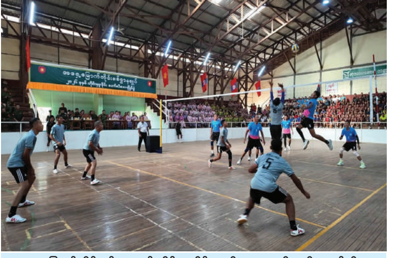
အရှေ့မြောက်တိုင်းစစ်ဌာနချုပ် တိုင်းမှူးခိုင်း အမျိုးသား၊ အမျိုးသမီး ဘော်လီဘော ပြိုင်ပွဲ အဖွင့်ပွဲစဉ်ယှဉ်ပြိုင်ကစားနေမှုကို တွေ့ရစဉ်။

နေပြည်တော် ၇ ဇူလိုင် - ဦးစွာ တိုင်းမှူးက အဖွင့်အမှာစကား ပြောကြားသည်။ ထို့နောက် တိုင်းမှူးနှင့် ၂၀၂၆ ခုနှစ် တိုင်းမှူးခိုင်း အမျိုးသား၊ အမျိုးသမီး ဘော်လီဘောပြိုင်ပွဲ ဖွင့်ပွဲကို ယနေ့မွန်းလွဲပိုင်းတွင် ရှမ်းပြည်နယ် (မြောက်ပိုင်း) လားရှိုးမြို့ ပြည်ထောင်စု အားကစားကွင်းရှိ အားကစားခန်းမ၌ ပြုလုပ်ရာ တိုင်းမှူး ဗိုလ်ချုပ်အေးမင်းဦး နှင့် တာဝန်ရှိသူများ၊ အရာရှိ၊ စစ်သည်၊ မိသားစုဝင်များ၊ ဒိုင်အဖွဲ့ဝင်များ၊ ပြိုင်ပွဲဝင် အသင်းများနှင့် အားကစားဝါသနာရှင်များ တက်ရောက်ကြသည်။ အဆိုပါ တိုင်းမှူးခိုင်း ဘော်လီဘော ပြိုင်ပွဲကို တိုင်းစစ်ဌာနချုပ် ကွပ်ကဲမှု အောက်တပ်နယ်အသီးသီးမှ ပြိုင်ပွဲဝင် အမျိုးသားအသင်း ၁၀ သင်းနှင့် အမျိုး သမီးအသင်း ၁၀ သင်းတို့ဖြင့် ဇူလိုင် ၃ ရက်ထိ ယှဉ်ပြိုင်ကစားသွားမည်ဖြစ် ကြောင်း သတင်းရရှိသည်။ (၅၀၁)