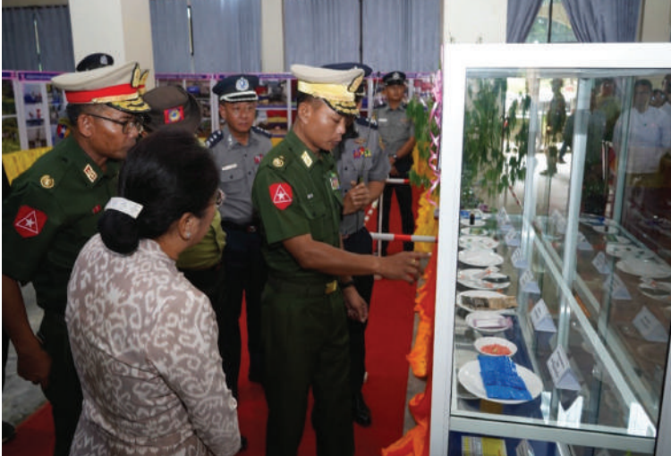
တြိဂံဒေသတိုင်းစစ်ဌာနချုပ် တိုင်းမှူး ဗိုလ်ချုပ်စိုးမြတ်ထွဋ် အပြည်ပြည်ဆိုင်ရာ မူးယစ်ဆေးဝါးအလွဲသုံးမှုနှင့် တရားမဝင်ရောင်းဝယ်မှုတိုက်ဖျက်ရေးနေ့ အထိမ်းအမှတ်ပြခန်းကို ကြည့်ရှုစဉ်။

နေပြည်တော် ၇ ဇူလိုင် - အပြည်ပြည်ဆိုင်ရာ မူးယစ်ဆေးဝါး အလွဲသုံးမှုနှင့် တရားမဝင်ရောင်းဝယ်မှု တိုက်ဖျက်ရေးနေ့အခမ်းအနားကို ယနေ့ နံနက်ပိုင်းတွင် ရှမ်းပြည်နယ်(အရှေ့ပိုင်း) ကျိုင်းတုံမြို့ရှိ မြို့တော်ခန်းမ၌ကျင်းပရာ တြိဂံဒေသတိုင်းစစ်ဌာနချုပ် တိုင်းမှူး ဗိုလ်ချုပ်စိုးမြတ်ထွဋ်နှင့် အဖွဲ့ဝင်များ၊ ဌာနဆိုင်ရာတာဝန်ရှိသူများ၊ ကျောင်း သား၊ ကျောင်းသူများနှင့်ဖိတ်ကြားထားသူ များ တက်ရောက်ကြသည်။