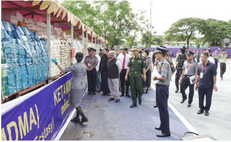
မြန်မာနိုင်ငံရဲတပ်ဖွဲ့ ရဲချုပ် ဒုတိယဗိုလ်ချုပ်ကြီးစိုးလှိုင်နှင့် တာဝန်ရှိသူများက ဖမ်းဆီးရမိမူးယစ်ဆေးဝါးများ၊ ဓာတုပစ္စည်းများကို ကြည့်ရှုစဉ်။