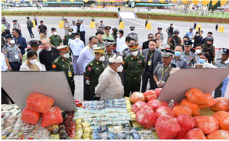
အရှေ့ပိုင်းတိုင်းစစ်ဌာနချုပ် တိုင်းမှူး ဗိုလ်မှူးချုပ်ကျော်နိုင်ဦး၊ ပြည်ထဲရေးဝန်ကြီးဌာန ဒုတိယဝန်ကြီးဗိုလ်ချုပ်မင်းသူနှင့် တာဝန်ရှိသူများက ဖမ်းဆီးရမိ မူးယစ်ဆေးဝါးများနှင့် ဓာတုပစ္စည်းများကို ကြည့်ရှုစဉ်။

❖ မူးယစ်ဆေးဝါးအလွဲသုံးမှုမှ တရားမဝင်ရောင်းဝယ်မှုတိုက်ဖျက်ရေးနေ့ ဌာန ဖမ်းဆီးရမိမူးယစ်ဆေးဝါးများ မီးရှို့ဖျက်ဆီးခြင်းကို ယနေ့နံနက် ၁၀နာရီခွဲတွင်တောင်ကြီးမြို့ အဝေရာကုန်းသာယာမီးပုံးပျံကွင်းနှင့် ဓာတုပစ္စည်းများ မြေမြှုပ်ဖျက်ဆီးခြင်းကို နံနက် ၁၁ နာရီ မိနစ် ၅၀ တွင် ထိဖောင်းကျေးရွာအုပ်စုရှိ ကျောက်ကျင်းဟောင်း၌ပြုလုပ်ရာ အရှေ့ပိုင်းတိုင်းစစ်ဌာနချုပ် တိုင်းမှူး ဗိုလ်မှူးချုပ်ကျော်နိုင်ဦး၊ မူးယစ်ဆေးဝါးနှင့် စိတ်ကိုပြောင်းလဲစေသော ဆေးဝါးများအန္တရာယ်တားဆီးနှိမ်နင်းရေးနှင့် စီမံခန့်ခွဲရေးအဖွဲ့ဥက္ကဋ္ဌ ပြည်ထဲရေးဝန်ကြီးဌာန ဒုတိယဝန်ကြီး ဗိုလ်ချုပ်မင်းသူ၊ ရှမ်းပြည်နယ်လွှတ်တော်ဥက္ကဋ္ဌနှင့် လွှတ်တော်ကိုယ်စားလှယ်များ၊ ပြည်နယ်အစိုးရအဖွဲ့ဝင်များ၊ တပ်မတော်အရာရှိကြီးများ၊ မြန်မာနိုင်ငံရဲတပ်ဖွဲ့မှ ရဲအရာရှိကြီးများ၊ ထိုင်းနိုင်ငံမူးယစ်ဆေးဝါးထိန်းချုပ်ရေးအဖွဲ့ (ONCB) နှင့် NGO အဖွဲ့အစည်းများကိုယ်စားလှယ်များ တက်ရောက်ကြသည်။ အဆိုပါ မီးရှို့ဖျက်ဆီးပွဲတွင် ရှမ်းပြည်နယ်နှင့် ကယားပြည်နယ်တို့မှ ဖမ်းဆီးရမိသည့် ဘိန်း ၄၇၂ ကီလိုကျော်၊ ဘိန်းဖြူ ၂၃၃ ကီလိုကျော်၊ စိတ်ကြွရူးသွပ်ဆေးပြား ၈၅ သန်းကျော်၊ အိုက်စ် ၁၁၅၄၄ ကီလိုကျော်၊ စိတ်ပြောင်းဆေးဝါး (Happy Water) ၅၃ ကီလိုကျော်၊ ကက်တမင်း ၁၄၆၆ ကီလိုခန့်၊ ဆေးခြောက် ၈၅ ကီလိုကျော်အပါအဝင် မူးယစ်ဆေးဝါး ၂၄ မျိုးနှင့် ဓာတုပစ္စည်း ၆၉ မျိုး စုစုပေါင်းတန်ဖိုး မြန်မာ