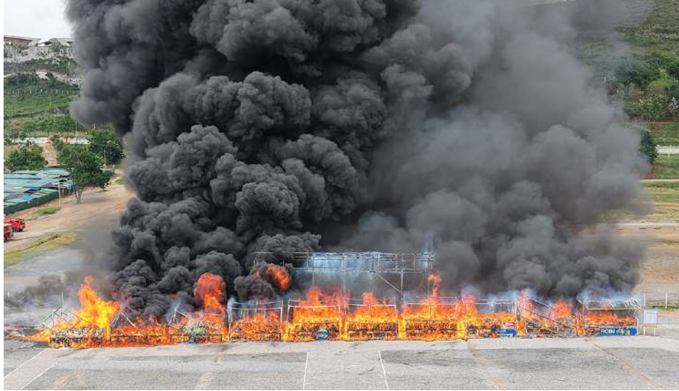
တောင်ကြီးမြို့၌ တစ်နှစ်တာကာလအတွင်း ဖမ်းဆီးရမိသည့် မူးယစ်ဆေးဝါးများနှင့် ဓာတုပစ္စည်းများ မီးရှို့ဖျက်ဆီးမှုကို တွေ့ရစဉ်။