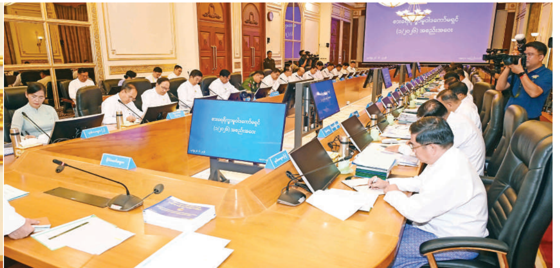
စားရေရိက္ခာမူဝါဒကော်မရှင်ဥက္ကဋ္ဌ နိုင်ငံတော်သမ္မတ ဦးမင်းအောင်လှိုင် စားရေရိက္ခာမူဝါဒကော်မရှင်အစည်းအဝေးတွင် အမှာစကားပြောကြားစဉ်။