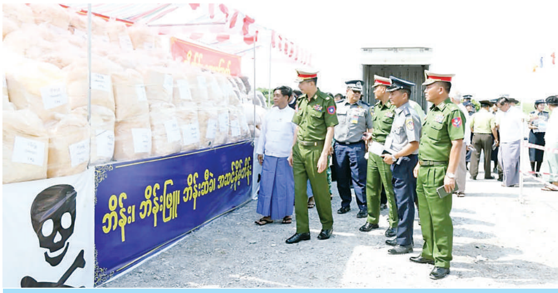
အလယ်ပိုင်းတိုင်းစစ်ဌာနချုပ် တိုင်းမှူး ဗိုလ်မှူးချုပ်အောင်ဌေး၊ မန္တလေးတိုင်းဒေသကြီးလွှတ်တော်ဥက္ကဋ္ဌနှင့် တာဝန်ရှိသူများက ဖမ်းဆီးရမိ မူးယစ်ဆေးဝါးများနှင့် ဓာတုပစ္စည်းများကို ကြည့်ရှုစဉ်။

နေပြည်တော် ဇွန် ၂၆ ၂၀၂၆ ခုနှစ် ဇွန် ၂၆ ရက်တွင် ကျရောက်သော အပြည်ပြည်ဆိုင်ရာ မူးယစ်ဆေးဝါးအလွဲသုံးမှုနှင့် တရားမဝင် ရောင်းဝယ်မှုတိုက်ဖျက်ရေးနေ့ အထိမ်းအမှတ်အခမ်းအနားများကို နေပြည်တော် ကောင်စီနယ်မြေတိုင်းဒေသကြီးပြည်နယ်များတွင်ကျင်းပခဲ့ပြီး တောင်ကြီးမြို့၊ ရန်ကုန်မြို့နှင့် မန္တလေးမြို့တို့တွင် တစ်နှစ်တာ ကာလအတွင်း ဖမ်းဆီးရမိမူးယစ်ဆေးဝါးများနှင့် ဓာတုပစ္စည်းများဖျက်ဆီးခြင်းကို တစ်ပြိုင်တည်းကျင်းပကြကာ စာပေ၊ ဂီတ ပြိုင်ပွဲများတွင် ဆုရရှိသူများကို ဆုများချီးမြှင့်ကြသည်။ ယနေ့ကျရောက်သည့် ၃၉ ကြိမ်မြောက် အပြည်ပြည်ဆိုင်ရာ မူးယစ်ဆေးဝါးအလွဲသုံးမှုနှင့် စာမျက်နှာ ၂၄ ကော်လံ ၁ ❖