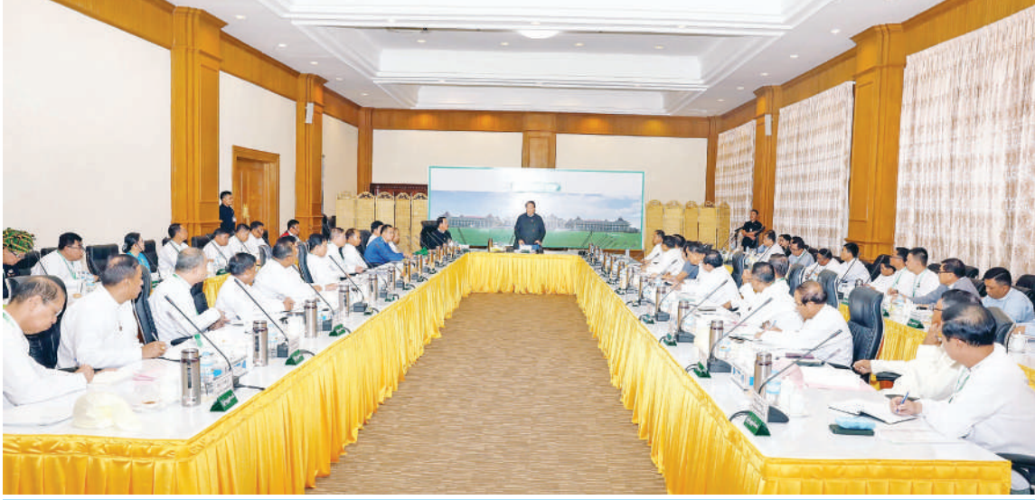
ပြည်သူ့လွှတ်တော်ဥက္ကဋ္ဌ ဦးခင်ရီ ပြည်သူ့လွှတ်တော်တွင် ဖွဲ့စည်းထားရှိသည့်ကော်မတီများမှ ဥက္ကဋ္ဌများ၊ အတွင်းရေးမှူးများနှင့် လုပ်ငန်းညှိနှိုင်းအစည်းအဝေး(၁/၂၀၂၆)တွင် အမှာစကားပြောကြားစဉ်။

နေပြည်တော် ၅ ဇူလိုင် ၂၆ ပြည်သူ့လွှတ်တော်ဥက္ကဋ္ဌနှင့် ပြည်သူ့လွှတ်တော်တွင် ဖွဲ့စည်းထားရှိသည့် ကော်မတီများမှ ဥက္ကဋ္ဌများ၊ အတွင်းရေးမှူးများနှင့် လုပ်ငန်းညှိနှိုင်းအစည်းအဝေး (၁/၂၀၂၆)ကို ယနေ့မနက် ၁ နာရီတွင် ပြည်သူ့လွှတ်တော် (၀)ဆောင် ဒုတိယထပ် အစည်းအဝေးခန်းမ၌ ကျင်းပသည်။ ဦးစွာ ပြည်သူ့လွှတ်တော်ဥက္ကဋ္ဌ ဦးခင်ရီက ပြည်သူ့လွှတ်တော်တွင် အမြဲတမ်းကော်မတီ လေးရပ် ဖွဲ့စည်းထားရှိပြီး အစိုးရအဖွဲ့က ဖွဲ့စည်းထားသော ဝန်ကြီးဌာနများနှင့် ပေါင်းစပ်ညှိနှိုင်းဆောင်ရွက်ရေးတွင် ရေးရာကော်မတီ ၂၂ ခု ဖွဲ့စည်းထားပါကြောင်း၊ ကော်မရှင်တစ်ခုလည်း ဖွဲ့စည်းရန် လျာထားပါကြောင်း၊ လွှတ်တော်ဆိုသည်မှာ သက်ဆိုင်ရာ မဲဆန္ဒနယ်မြေများရှိ မဲဆန္ဒရှင်ပြည်သူများက ရွေးချယ်ပေးလိုက်သည့် ကိုယ်စားလှယ်များဖြင့် ဖွဲ့စည်းထားသည့်နေရာဖြစ်ပါကြောင်း၊ လွှတ်တော်၏ တာဝန်များအနေဖြင့် အစိုးရတစ်ရပ်ဖြစ်တည်ရေးအတွက် နိုင်ငံအကြီးအကဲများနှင့် လွှတ်တော်အကြီးအမှူးများကို ရွေးချယ်တင်မြှောက်ပေးရပါကြောင်း၊ လွှတ်တော်၏ အဓိကလုပ်ငန်းတာဝန်တစ်ရပ်မှာ ဥပဒေပြုရေးဖြစ်ပါကြောင်း၊ လွှတ်တော်၏ လုပ်ငန်းတာဝန်များ ပီပီပြင်ပြင်ဆောင်ရွက်နိုင်ရေးအတွက် ဖွဲ့စည်းထားသည့် ကော်မတီများသည် လွန်စွာအရေးကြီးပါကြောင်း။