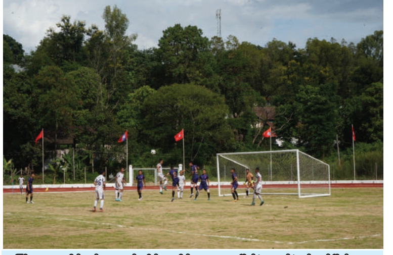
တြိဂံဒေသတိုင်းစစ်ဌာနချုပ် တိုင်းမှူးခိုင်း ဘောလုံးပြိုင်ပွဲ အဖွင့်ပွဲစဉ်ယှဉ်ပြိုင်ကစား နေမှုကို တွေ့ရစဉ်။

နေပြည်တော် ၇ ဇူလိုင် - ပြောကြားသည်။ ထို့နောက် တိုင်းမှူးနှင့် တြိဂံဒေသတိုင်းစစ်ဌာနချုပ် ၂၀၂၆ ခုနှစ် တိုင်းမှူးခိုင်း ဘောလုံးပြိုင်ပွဲ ဖွင့်ပွဲကို ယနေ့မွန်းလွဲပိုင်းတွင် တိုင်းစစ်ဌာနချုပ်ရှိ အားကစားကွင်း၌ပြုလုပ်ရာ တိုင်းမှူး ဗိုလ်ချုပ်စိုးမြတ်ထွဋ်နှင့် တာဝန်ရှိသူများ၊ အရာရှိ၊ စစ်သည်၊ မိသားစုဝင်များ၊ ဒိုင် အဖွဲ့ဝင်များ၊ ပြိုင်ပွဲဝင်အသင်းများ၊ အားကစားဝါသနာရှင်များနှင့် ဖိတ်ကြား ထားသူများ တက်ရောက်ကြသည်။ ဦးစွာ တိုင်းမှူးက အဖွင့်အမှာစကား ပြောကြားသည်။ ထို့နောက် တိုင်းမှူးနှင့် တက်ရောက်လာကြသူများက အဖွင့်ပွဲစဉ် ယှဉ်ပြိုင်နေမှုများကို ကြည့်ရှုအားပေး ကြသည်။ အဆိုပါ တိုင်းမှူးခိုင်း ဘောလုံးပြိုင်ပွဲ ကို တိုင်းစစ်ဌာနချုပ် ကွပ်ကဲမှုအောက် တပ်နယ်အသီးသီးမှ ပြိုင်ပွဲဝင်အသင်း ၁၄ သင်းဖြင့် ဇူလိုင် ၁၀ ရက်ထိ ယှဉ်ပြိုင် ကစားသွားမည်ဖြစ်ကြောင်း သတင်း ရရှိသည်။ (၅၀၁)