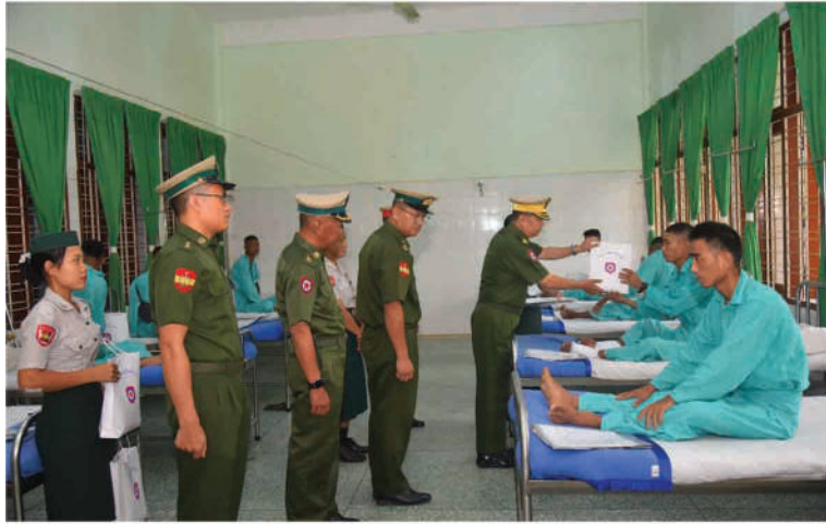
နေပြည်တော်တိုင်းစစ်ဌာနချုပ် တိုင်းမှူး ဗိုလ်ချုပ်ကြည်သိုက် ဆေးကုသမှုခံယူနေသူများကို ရင်းရင်းနှီးနှီးမေးမြန်းအားပေးစကားပြောကြားပြီး အာဟာရဖြည့်စားသောက်ဖွယ်ရာများနှင့် ချီးမြှင့်ငွေများပေးအပ်စဉ်။