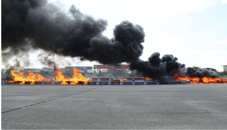
မန္တလေးမြို့၌ တစ်နှစ်တာကာလအတွင်း ဖမ်းဆီးရမိသည့် မူးယစ်ဆေးဝါးများနှင့် ဓာတုပစ္စည်းများ မီးရှို့ဖျက်ဆီးမှုကို တွေ့ရစဉ်။

ကြသည်။ ယခုနှစ်တွင် ဖမ်းဆီးရမိမူးယစ်ဆေးဝါးများနှင့် ဓာတုပစ္စည်းများ မီးရှို့မြေမြှုပ်ဖျက်ဆီးခြင်း အခမ်းအနားများကို တောင်ကြီးမြို့၊ ရန်ကုန်မြို့၊ မန္တလေးမြို့တို့တွင်ကျင်းပခဲ့ရာ ဘိန်း ၁၀၆၆ ကီလိုခန့်၊ ဘိန်းဖြူ ၂၂၄၉ ကီလိုကျော်၊ စိတ်ကြွရူးသွပ်ဆေးပြား ၃၉၁ သန်းကျော်၊ အိုက်စ် ၃၉၇၀၈ ကီလိုခန့်၊ စိတ်ပြောင်းဆေးဝါး (Happy Water) ၁၅၈ ကီလိုကျော်၊ ဘိန်းစာမှုန့် ၂၆၄ ကီလိုခန့်၊ ဆေးခြောက် ၁၁၄၈ ကီလိုခန့်နှင့် ကက်တမင်း ၈၆၁၁ ကီလိုကျော်အပါအဝင် မူးယစ်ဆေးဝါးနှင့် ဓာတုပစ္စည်းအမျိုး ၁၁၀ စုစုပေါင်းတန်ဖိုး မြန်မာငွေကျပ်ဘီလီယံ ၂၂၁၀ ခန့် (အမေရိကန်ဒေါ်လာ ၆၀၃ သန်းကျော်)တို့ကို ဖျက်ဆီးခဲ့ခြင်းဖြစ်သည်။ နိုင်ငံတော်သမ္မတ၏ လမ်းညွှန်ချက်နှင့်အညီ မူးယစ်ဆေးဝါးတားဆီးနှိမ်နင်းရေး လုပ်ငန်းများကို တပ်မတော်၊ မြန်မာနိုင်ငံရဲတပ်ဖွဲ့၊ အကောက်ခွန်ဦးစီးဌာန၊ မူးယစ်ဆေးဝါးအဟုန်မြှင့် ကြိုးပမ်းဆောင်ရွက်မှုကြောင့် မူးယစ်ဆေးဝါးနှင့် ဓာတုပစ္စည်းအများအပြားဖမ်းဆီးရမိကာ ဖျက်ဆီးနိုင်ခဲ့ကြောင်းနှင့် ၂၀၂၅ ခုနှစ် ဇွန် ၁ ရက်မှ ၂၀၂၆ ခုနှစ် မေ ၃၁ ရက်ထိ တစ်နှစ်တာကာလအတွင်း မြန်မာနိုင်ငံ၌ ငွေကျပ်ဘီလီယံ ၂၂၁၀ ခန့်တန်ဖိုးရှိ မူးယစ်ဆေးဝါးနှင့် ဓာတုပစ္စည်းများ ဖော်ထုတ်ဖမ်းဆီးအရေးယူနိုင်ခဲ့ကြောင်း မြန်မာနိုင်ငံ ရဲတပ်ဖွဲ့မှ သတင်းရရှိသည်။ (သတင်းစဉ်)