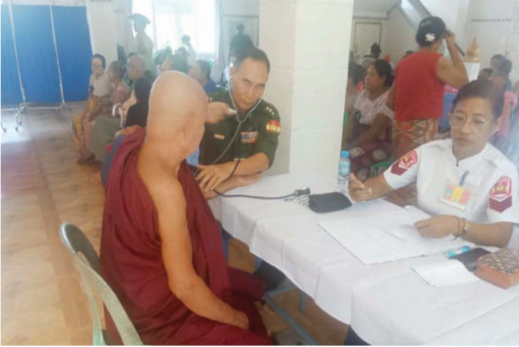
သံဃာတော်များ၊ ဒေသခံပြည်သူများကို ရန်ကုန်တိုင်းစစ်ဌာနချုပ် နယ်လှည့်ဆေးကုသရေးအဖွဲ့က ကျန်းမာရေးစောင့်ရှောက်မှုလုပ်ငန်းများ ဆောင်ရွက်ပေးစဉ်။

နေပြည်တော် ၇ ဇူလိုင် - တိုင်းရင်းသား တပ်မတော်အနေဖြင့် တိုင်းရင်းသား တပ်မတော်အနေဖြင့် တိုင်းရင်းသား တပ်မတော် နယ်လှည့်ဆေးကုသရေးအဖွဲ့ များက ဒေသအသီးသီးရှိ ဒေသခံတိုင်းရင်း သားပြည်သူများကို ၎င်းတို့၏ မြို့နယ်၊ ကျေးရွာများအရောက် သွားရောက်၍ လူမျိုး၊ ဘာသာမရွေး ဆေးကုသပေးခြင်း