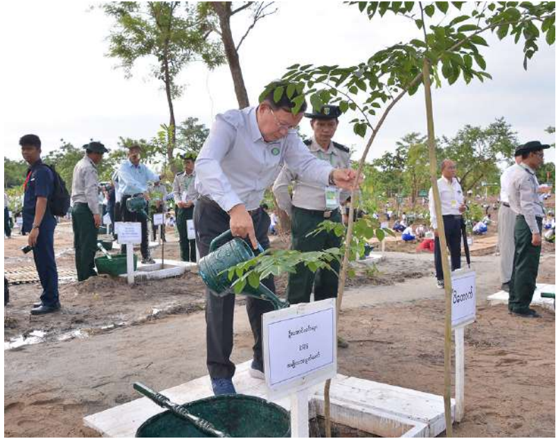
အမျိုးသားလွှတ်တော်ဥက္ကဋ္ဌ ဦးအောင်လင်းခွေး ပျိုးပင်ကို စိုက်ပျိုးပေးစဉ်။