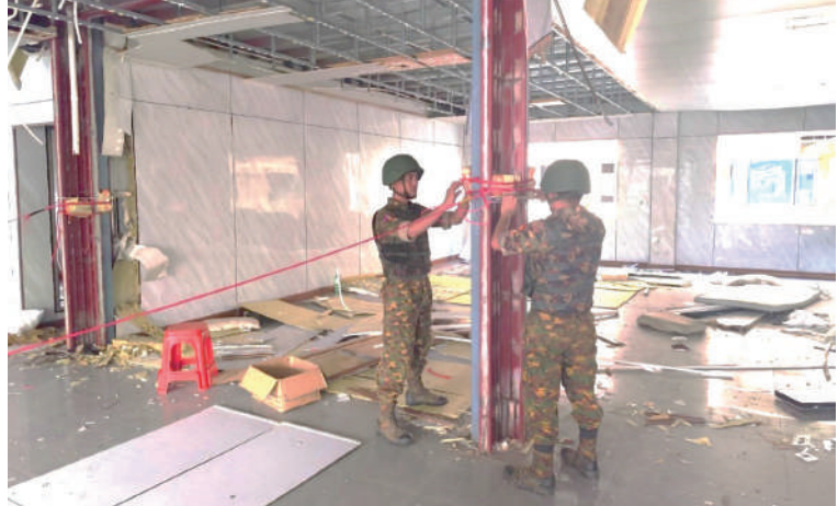
ကရင်ပြည်နယ် မြဝတီခရိုင် ရွှေကုက္ကိုလ်နယ်မြေရှိ အွန်လိုင်းလိမ်လည်လောင်းကစားမှုလုပ်ကိုင်ခဲ့သည့် တရားမဝင် ခုနစ်ထပ် လူနေအဆောက်အအုံကို ယမ်းဖြင့် ဖောက်ခွဲဖျက်ဆီးရန် ပြင်ဆင်နေစဉ်။

❖ ရွှေကုက္ကိုလ်မှ ယနေ့တွင် ရွှေကုက္ကိုလ်နယ်မြေအတွင်းရှိ တရားမဝင် ခုနစ်ထပ် လူနေအဆောက်အအုံ တစ်လုံးကို ထပ်မံ၍ စနစ်တကျ ဖောက်ခွဲဖျက်ဆီးခဲ့ကြောင်း သိရသည်။ ရွှေကုက္ကိုလ် နယ်မြေအတွင်း၌ အွန်လိုင်းလိမ်လည် လောင်းကစားလုပ်ငန်းများ ကျူးလွန်ရာတွင်အသုံးပြု ခဲ့သည့် အဆောက်အအုံ ၇၇ လုံးအနက် ယာဉ်ယန္တရားများဖြင့် ဖြိုဖျက်ဆီးမည့် အဆောက်အအုံ ၅၇ လုံးနှင့် ဖောက်ခွဲဖျက်ဆီးမည့် အဆောက်အအုံအလုံး ၂၀ ဟူ၍ အဆောက်အအုံအမျိုးအစားအလိုက် ခွဲခြားသတ်မှတ်ပြီး စနစ်တကျဖြိုဖျက်ဆီးလျက်ရှိရာ ယနေ့တွင်ဖောက်ခွဲ၍ ဖြိုဖျက်ဆီးရန် သတ်မှတ်ထားသည့် အဆောက်အအုံ အလုံး ၂၀ အနက် ခုနစ်ထပ် လူနေအဆောက်အအုံ တစ်လုံးကို စနစ်တကျ ထပ်မံဖောက်ခွဲဖျက်ဆီးခဲ့ကြောင်း သိရသည်။ ဌာနဆိုင်ရာ ပူးပေါင်းအဖွဲ့များအနေ ဖြင့် ယနေ့ထိ အွန်လိုင်းလိမ်လည်လောင်းကစားမှုလုပ်ငန်းများ ကျူးလွန်ရာတွင် အသုံးပြုခဲ့သည့် တရားမဝင် အဆောက်အအုံ စုစုပေါင်း ၆၄ လုံးကို စနစ်တကျ ဖြိုဖျက်ဆီးပြီးဖြစ်ကြောင်းနှင့် ဖျက်ဆီးရန်ကျန်ရှိသည့် တရားမဝင်အဆောက်အအုံ ၁၃ လုံးကိုလည်း ဆက်လက်၍ စနစ်တကျ ဖျက်ဆီးသွားမည်ဖြစ်ကြောင်း သတင်းရရှိသည်။ (၅၀၁)