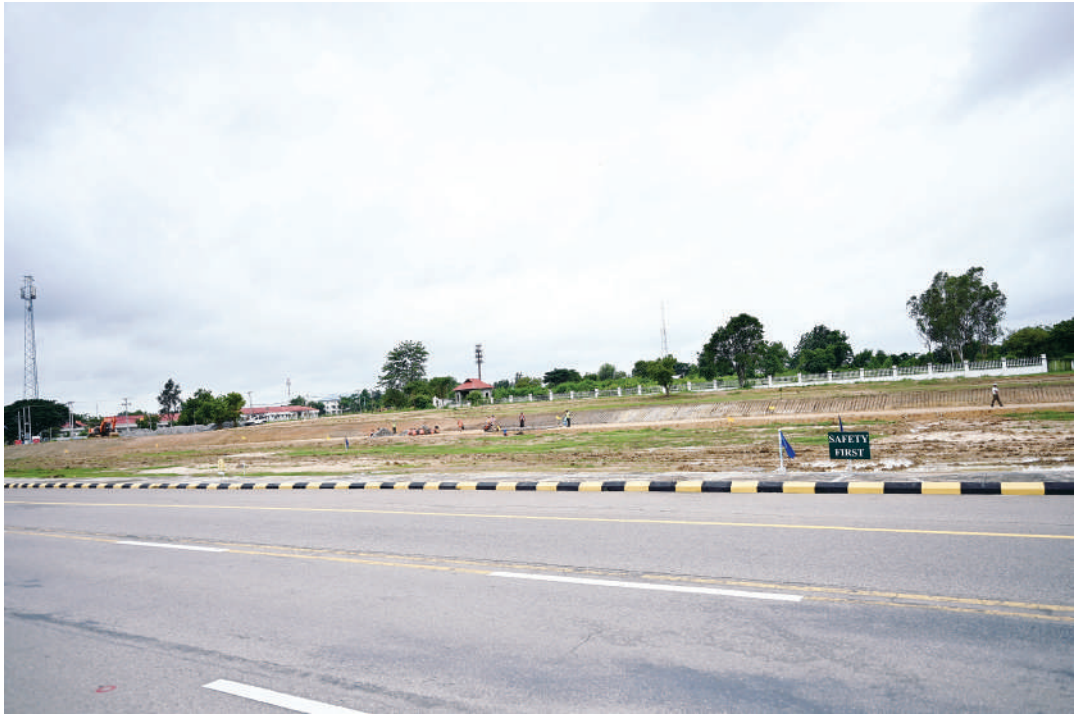
ပြည်ထောင်စုသမ္မတမြန်မာနိုင်ငံတော် နိုင်ငံတော်သမ္မတ ဦးမင်းအောင်လှိုင် နေပြည်တော်မြို့အဝင်မုခ်ဦး(Naypyitaw Gate) တည်ဆောက်နေမှုလုပ်ငန်းခွင်သို့ သွားရောက်ကြည့်ရှုစစ်ဆေးစဉ်။

နေပြည်တော် ဇွန် ၂၅ ပြည်ထောင်စုနယ်မြေ နေပြည်တော် ကို မြို့ပြဖွံ့ဖြိုးတိုးတက်ရေးအတွက် စိမ်းလန်းစိုပြည်သောမြို့ (Green City)၊ သန့်ရှင်းသောမြို့(Clean City)နှင့် ခေတ်မီ နည်းပညာအခြေပြုမြို့ပြ (Smart City) အဖြစ် ဘက်စုံကဏ္ဍစုံမှ အကောင်အထည် ဖော်တည်ဆောက်လျက်ရှိပြီး နေပြည် တော်မြို့အဝင်မုခ်ဦး(Naypyitaw Gate) ကိုလည်း မြို့တော်အဝင် အထင်ကရ အမှတ်အသားဖြစ်စေရန်၊ မြို့တော်အတွင်း သို့ ဝင်ရောက်လာသူများကို မင်္ဂလာရှိစွာ ကြိုဆိုရန်၊ နိုင်ငံ၏ မြို့ပြဂုဏ်သိက္ခာနှင့် အဆင့်အတန်းကို မြှင့်တင်နိုင်ရန်၊ မြန်မာ့ ယဉ်ကျေးမှုနှင့် သမိုင်းကြောင်းကို ထိန်းသိမ်းဖော်ပြရန် စသည့် ရည်ရွယ် ချက်များဖြင့် တည်ဆောက်လျက်ရှိသည်။ ထိုသို့ ဆောင်ရွက်လျက်ရှိရာ ပြည်ထောင်စုသမ္မတ မြန်မာနိုင်ငံတော် နိုင်ငံတော်သမ္မတ ဦးမင်းအောင်လှိုင်သည် ယနေ့နံနက်ပိုင်းတွင် ဒုတိယသမ္မတများ ဖြစ်ကြသည့် ဦးညိုစော၊ ဒေါ်နန်းနီနီအေး နှင့် တာဝန်ရှိသူများ လိုက်ပါ၍ နေပြည် တော်မြို့အဝင်မုခ်ဦး တည်ဆောက်နေမှု