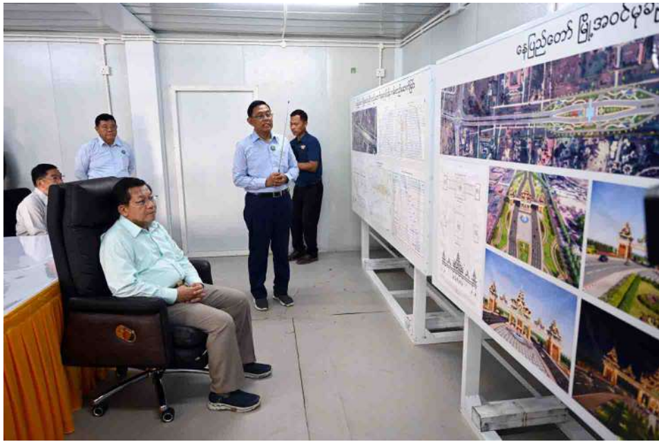
President U Min Aung Hlaing hears reports on the Naypyitaw Gate construction project.