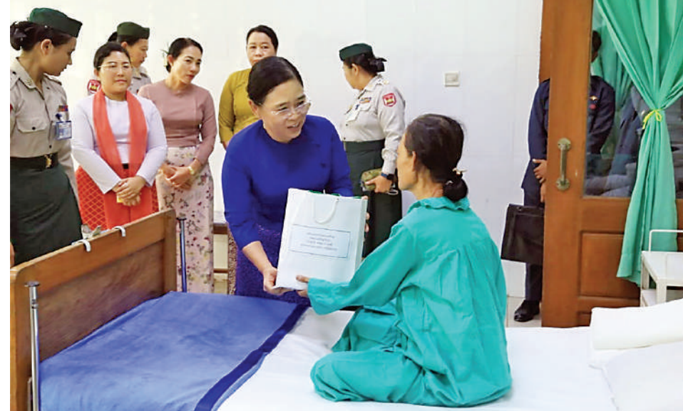
ဒုတိယတပ်မတော်ကာကွယ်ရေးဦးစီးချုပ် ကာကွယ်ရေးဦးစီးချုပ်(ကြည်း) ဗိုလ်ချုပ်ကြီးကျော်စွာလင်း၏ ဇနီး ဒေါ်နန်းကူးကူ အမျိုးသမီးနှင့်ကလေးကုသဆောင်ရှိ လူနာများကို လိုက်လံကြည့်ရှုအားပေးစကား ပြောကြားပြီး စားသောက်ဖွယ်ရာများနှင့် ချီးမြှင့်ငွေများ ပေးအပ်စဉ်။

လိုကြောင်း၊ ထို့ပြင် မိမိတို့အဖွဲ့အစည်းနှင့် သက်ဆိုင်သည့် ဘာသာရပ်များကိုလည်း ကျွမ်းကျင်ပိုင်နိုင်အောင် Professional ကျကျ အမြဲမပြတ် လေ့လာဆည်းပူး နေကြရန်လိုကြောင်း၊ လေ့ကျင့်သင်ကြား ထားရှိသည့် စစ်အတတ်ပညာများ၊ စစ်နည်းဗျူဟာများကို “လေ့လာ၊ လေ့ကျင့်၊ လိုက်နာ” ဆိုသည့် ဆောင်ပုဒ် အတိုင်း လိုက်နာဆောင်ရွက်သွားကြရန် လိုကြောင်း၊ ထိုသို့ အကြိမ်ကြိမ် အဖန်ဖန် လေ့ကျင့်နေမှသာ ကျွမ်းကျင်မှုရှိ၍ မိမိကိုယ်ကို ယုံကြည်မှုရှိလာမည်ဖြစ်ပြီး တိုက်ပွဲဝင်သည့်အခါ ရဲစွမ်းသတ္တိများ ဖြင့် အောင်ပွဲဆင်နိုင်မည်ဖြစ်ကြောင်း၊ ပြောင်းလဲတိုးတက်လာသည့် နည်းပညာ မြင့်စစ်လက်နက်ပစ္စည်းများ၊ စစ်အတတ် ပညာများကိုလည်း စဉ်ဆက်မပြတ် လေ့လာပြီး လက်တွေ့နယ်ပယ်တွင် ကြုံတွေ့ရသည့် အတွေ့အကြုံများနှင့် ပေါင်းစပ်၍ စစ်ဆင်ရေးတာဝန်များ ထမ်းဆောင်ရာတွင် အောင်မြင်အောင် ထမ်းဆောင်ကြရန်လိုကြောင်း။