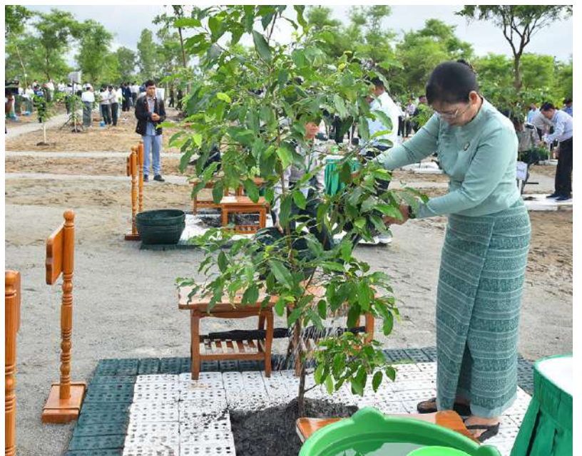
ဒုတိယသမ္မတ ဒေါ်နန်းနီနီအေး ပျိုးပင်ကို စိုက်ပျိုးပေးစဉ်။