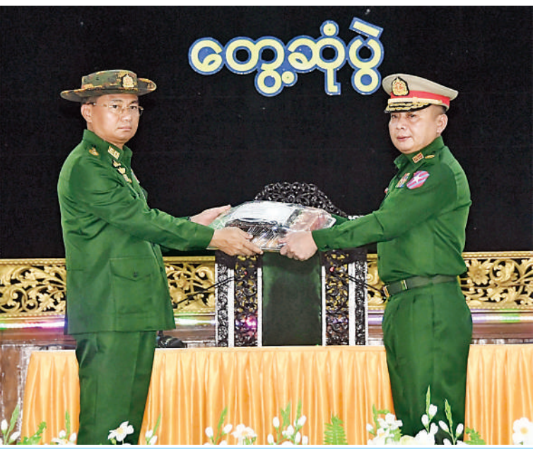
ဒုတိယတပ်မတော်ကာကွယ်ရေးဦးစီးချုပ် ကာကွယ်ရေးဦးစီးချုပ်(ကြည်း) ဗိုလ်ချုပ်ကြီးကျော်စွာလင်း တပ်နယ်မှ အရာရှိ၊ စစ်သည်၊ မိသားစုများအတွက် စားသောက်ဖွယ်ရာများနှင့် စာအုပ်စာစောင်များပေးအပ်ရာ တိုင်းမှူးကလက်ခံရယူစဉ်။

ဦးစွာ ဒုတိယတပ်မတော်ကာကွယ်ရေးဦးစီးချုပ် ကာကွယ်ရေးဦးစီးချုပ်(ကြည်း) က ၂၀၂၀ ပြည့်နှစ် ပါတီစုံဒီမိုကရေစီ အထွေထွေရွေးကောက်ပွဲတွင် အာဏာရ ပါတီအနေဖြင့် မဲမသမာမှုများဆောင်ရွက်ပြီး နိုင်ငံတော်၏အာဏာကို အမွေရယူရန် ဆောင်ရွက်ခဲ့ခြင်းကြောင့် တပ်မတော်အနေဖြင့် ဖွဲ့စည်းပုံအခြေခံဥပဒေ (၂၀၀၈ ခုနှစ်)နှင့်အညီ နိုင်ငံအရေးအတွက် နိုင်ငံတော်၏ တာဝန်အရပ်ရပ်ကို ထမ်းဆောင်ခဲ့ကြောင်း၊ တပ်မတော်အနေဖြင့် နိုင်ငံတော်တာဝန်များကို စတင်ထမ်းဆောင်ချိန်တွင် တည်ငြိမ်အေးချမ်းရေးကို မလိုလားသည့် ပြည်တွင်း၊ ပြည်ပမှ အဖွဲ့အစည်းများ၊ ပြည်ပကုန်သွယ်ရေးကုမ္ပဏီများ၏ သွေးထိုးလှုံ့ဆော်မှုများကြောင့် တရားမဝင်ဖွဲ့စည်းထားသည့် CRPH နှင့် NUG အမည်ခံ အကြမ်းဖက် အဖွဲ့အစည်းများသည် နိုင်ငံရေးကို နိုင်ငံရေးနည်းလမ်းဖြင့် မဖြေရှင်းဘဲ လက်နက်ကိုင်အကြမ်းဖက် လမ်းစဉ်ကိုရွေးချယ်ကာ နိုင်ငံ၏နယ်မြေဒေသအချို့တွင် အကြမ်းဖက်လုပ်ငန်းများကို လုပ်ဆောင်လာကြောင်း၊ ထို့ကြောင့် တပ်မတော်အနေဖြင့် နယ်မြေတည်ငြိမ်အေးချမ်းရေးနှင့် ဒေသတွင်းဖွံ့ဖြိုးတိုးတက်ရေးလုပ်ငန်းများကို လုပ်ဆောင်ရန်အတွက် တည်ငြိမ်အေးချမ်းမှုကို လိုလားသည့် တိုင်းရင်းသားပြည်သူများနှင့်လက်တွဲကာ အကြမ်းဖက်သမားများကို တရားဥပဒေနှင့်အညီ ထိန်းထိန်းသိမ်းသိမ်းဖြင့် ဖြေရှင်းဆောင်ရွက်ခဲ့ကြောင်း။