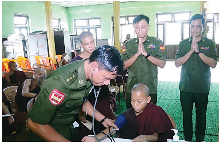
သံဃာတော်များအား ကျန်းမာရေးစောင့်ရှောက်မှုလုပ်ငန်းများ ဆောင်ရွက်ပေးနေမှုကို မြစ်ကြီးနားတပ်နယ်မှ တာဝန်ရှိသူများက ကြည့်ရှုအားပေးစဉ်။

နေပြည်တော် ဇွန် ၂၅ ရက်နေ့တွင် မြစ်ကြီးနားတပ်နယ်မှ တာဝန်ရှိသူများက ကြည့်ရှုအားပေးစဉ် သံဃာတော်များအား ကျန်းမာရေးစောင့်ရှောက်မှုလုပ်ငန်းများ ဆောင်ရွက်ပေးခဲ့သည်။ မြစ်ကြီးနားတပ်နယ်မှ တာဝန်ရှိသူများက ကြည့်ရှုအားပေးစဉ် သံဃာတော်များအား ကျန်းမာရေးစောင့်ရှောက်မှုလုပ်ငန်းများ ဆောင်ရွက်ပေးခဲ့သည်။ မြစ်ကြီးနားတပ်နယ်မှ တာဝန်ရှိသူများက ကြည့်ရှုအားပေးစဉ် သံဃာတော်များအား ကျန်းမာရေးစောင့်ရှောက်မှုလုပ်ငန်းများ ဆောင်ရွက်ပေးခဲ့သည်။