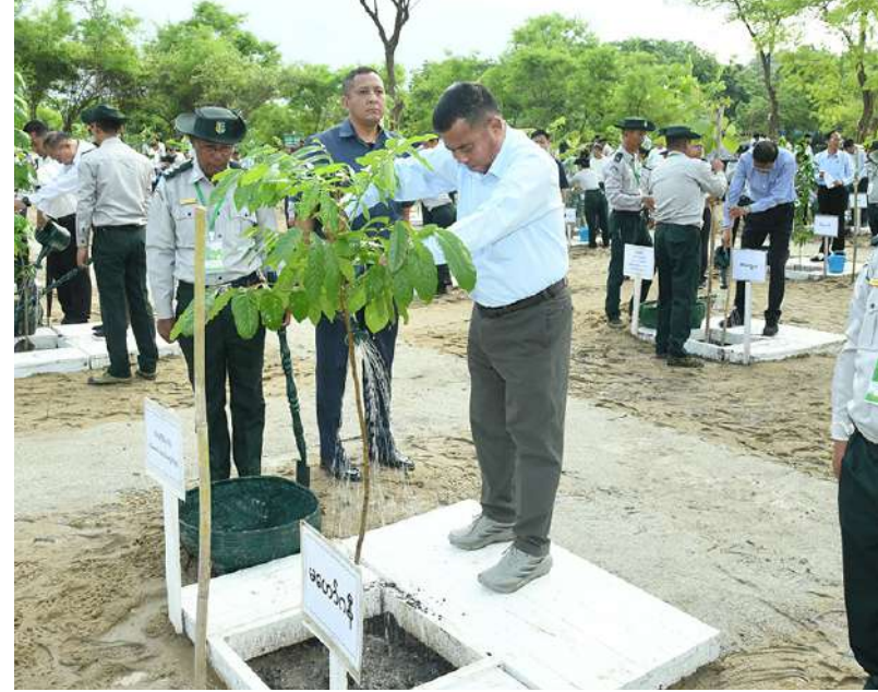
တပ်မတော်ကာကွယ်ရေးဦးစီးချုပ် ဗိုလ်ချုပ်ကြီးရဲဝင်းဦး ပျိုးပင်ကို စိုက်ပျိုးပေးစဉ်။

မှုကိုထိန်းညှိပေးကြောင်း၊ သစ်ပင်အရိပ်အာဝါသရှိသည့်နေရာသည် သစ်ပင်မရှိသည့်မြို့ပြနေရာများထက် အပူချိန် ၂ ဒီဂရီဆဲလ်ဆီးယပ်မှ ၈ ဒီဂရီဆဲလ်ဆီးယပ်ထိ ပိုမိုအေးမြစေကြောင်း၊ သစ်ပင်များသည် သဘာဝအလျောက် အပူဒဏ်ကိုထိန်းသိမ်းပေးသောကြောင့် အေးမြသည့်အရိပ်အာဝါသကိုဖြစ်စေပြီး သစ်ရွက်များမှ ရေငွေ့ပြန်ခြင်းဖြစ်စဉ်သည်လည်း ပတ်ဝန်းကျင်လေထုကို အေးမြစေကြောင်း။