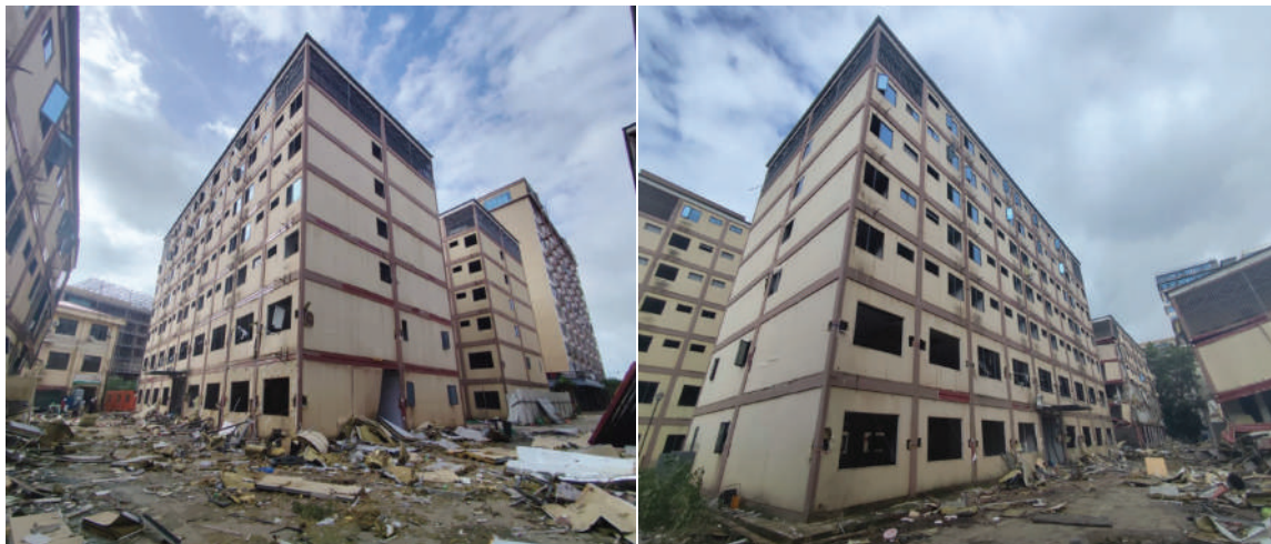
ကရင်ပြည်နယ် မြဝတီခရိုင် ရွှေကုက္ကိုလ်နယ်မြေရှိ အွန်လိုင်းလိမ်လည်လောင်းကစားမှုလုပ်ကိုင်ခဲ့သည့် တရားမဝင် ခုနစ်ထပ် လူနေအဆောက်အအုံ မဖြိုဖျက်မီ တွေ့ရစဉ်။

နေသော နိုင်ငံခြားသားများကို ဖော်ထုတ်ဖမ်းဆီးရမိသူများကို ထိထိရောက်ရောက် ပြင်းပြင်းထန်ထန် အရေးယူနိုင်ရေးအိမ်နီးချင်းနိုင်ငံများနှင့် ဒေသတွင်းနိုင်ငံများ၊ နိုင်ငံတကာ အဖွဲ့အစည်းများနှင့် တက်ကြွစွာ ပူးပေါင်းဆောင်ရွက်လျက်ရှိသည့်အပြင် လုံးဝအမြစ်ပြတ်ပျောက်သွားစေရေးနှင့် မြန်မာနိုင်ငံအတွင်း အခြေချ လုပ်ကိုင်နိုင်မှုမရှိစေရေးအတွက် အွန်လိုင်းလိမ်လည်မှုနှင့် လောင်းကစားမှု တိုက်ဖျက်ရေး လုပ်ငန်းစဉ်များကို တက်ကြွစွာ ဆက်လက်ဆောင်ရွက်လျက် ရှိကြောင်း သတင်းရရှိသည်။ (၅၀၁)