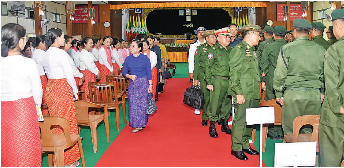
ဒုတိယတပ်မတော်ကာကွယ်ရေးဦးစီးချုပ် ကာကွယ်ရေးဦးစီးချုပ်(ကြည်း) ဗိုလ်ချုပ်ကြီးကျော်စွာလင်းနှင့် ဇနီး ဒေါ်နန်းကူးကူ တက်ရောက်လာကြသည့် အရာရှိ၊ စစ်သည်၊ မိသားစုဝင်များကို ရင်းရင်းနှီးနှီးလိုက်လံနှုတ်ဆက်စဉ်။

မိမိတို့နိုင်ငံ၏ တည်ငြိမ်အေးချမ်းမှုကို ပျက်ပြားစေရန် လုပ်ဆောင်လာသူမှန်သမျှ ကို တပ်မတော်အနေဖြင့် နှိမ်နင်းဆောင်ရွက်သွားမည်ဖြစ်ကြောင်း၊ ထိုကဲ့သို့ ဆောင်ရွက်ရန်အတွက် တပ်မတော် အနေဖြင့် အင်အားတောင့်တင်းပြီး စွမ်းရည်ထက်မြက်သော တပ်မတော် ဖြစ်ရန်လိုကြောင်း၊ စွမ်းရည်ထက်မြက်ရန် အတွက် မိမိတို့နှင့်သက်ဆိုင်ရာ နေ့စဉ် လုပ်ဆောင်ရသည့် သမားစဉ်လုပ်ငန်းများကို စနစ်တကျဆောင်ရွက်နေကြရန်