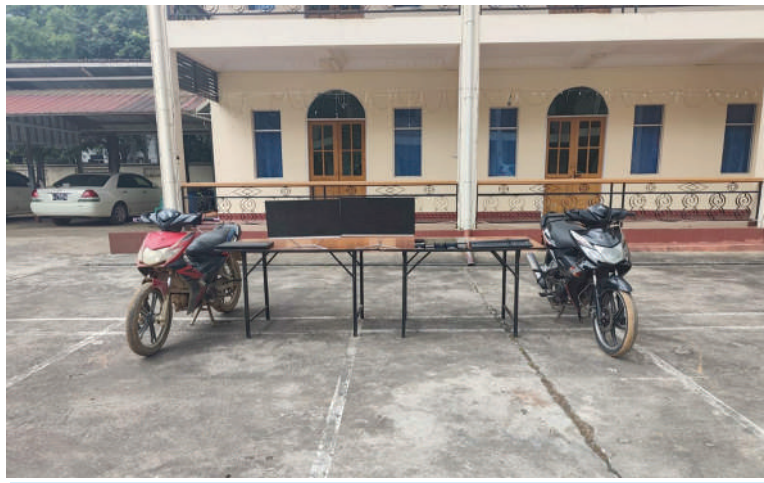
အွန်လိုင်းလိမ်လည်လောင်းကစားမှု ကျူးလွန်ရာတွင် အသုံးပြုသည့် လုပ်ငန်းသုံးပစ္စည်းများကို တွေ့ရစဉ်။

■ မုဆယ်မြို့မှ အလုံးစုံ အန္တရာယ်ပေးလျက်ရှိသည့် အွန်လိုင်းလိမ်လည်မှုနှင့် အွန်လိုင်းလောင်းကစားမှု တိုက်ဖျက်ရေးလုပ်ငန်းစဉ်များကို အမျိုးသားရေး တာဝန်တစ်ရပ်အဖြစ်ခံယူကာ အလေးထားဆောင်ရွက်လျက်ရှိပြီး ပြည်တွင်းအင်အားစုများအပြင် အိမ်နီးချင်းနိုင်ငံအစိုးရများနှင့်လည်း ပေါင်းစပ်ညှိနှိုင်း၍ စဉ်ဆက်မပြတ် အရှိန်အဟုန်ဖြင့် တင်ပြတ်ပြတ်သားသားနှိမ်နင်းတိုက်ဖျက်လျက်ရှိသည်။ (မြောက်ပိုင်း) မုဆယ်မြို့ ကောင်းမူလွယ်နယ်မြေ ကောင်းမူတုံရပ်ကွက်ရှိ နေအိမ်တစ်လုံးအတွင်းမှ အွန်လိုင်းလိမ်လည်လောင်းကစားမှုကျူးလွန်သူ တရားမဝင် တရုတ်နိုင်ငံသား အမျိုးသား ခုနစ်ဦးကို ဖမ်းဆီးရမိသည့်နေရာ နှစ်စီး၊ Laptop တစ်လုံး၊ဆိုင်ကယ် နှစ်စီး၊ အခြားလုပ်ငန်းသုံး ဆက်စပ်ပစ္စည်းများနှင့်အတူ ဖမ်းဆီးရမိခဲ့သည်။ အဆိုပါ အွန်လိုင်းလိမ်လည်လောင်းကစားမှုများ လုပ်ကိုင်လျက်ရှိသည့် ဖမ်းဆီးရမိသူများကို လိုအပ်သည့် စစ်ဆေးမှုများ ဆောင်ရွက်ပြီးစီးပါက တည်ဆဲဥပဒေများနှင့်အညီ ထိရောက် ပြင်းထန်စွာ အရေးယူဆောင်ရွက်သွားမည်ဖြစ်ပြီး သိမ်းဆည်းရမိသည့် လုပ်ငန်းသုံးပစ္စည်းများကို လုပ်ထုံးလုပ်နည်းများနှင့်အညီ ဆက်လက်ဆောင်ရွက်သွားမည် ဖြစ်ကြောင်း သိရသည်။ နိုင်ငံတော်အနေဖြင့် အွန်လိုင်းလိမ်လည်မှု၊ အွန်လိုင်းလောင်းကစားမှုနှင့် ဒုစရိုက်မှုမှန်သမျှတို့တွင် ပါဝင်ပတ်သက်နေသူများနှင့် နောက်ကွယ်မှ ကြိုးကိုင်