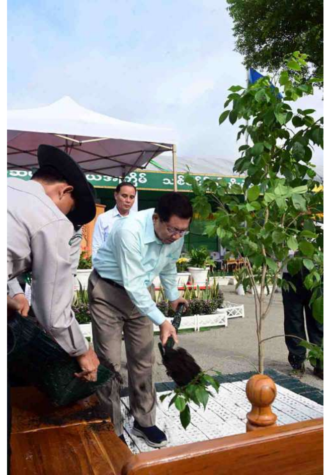
President U Min Aung Hlaing plants a gum-kino sapling.

Nay Pyi Taw June 25 The second national-level monsoon tree-growing ceremony for 2026 took place near Tawwin Yadana Road in Dekkhithiri Township in Nay Pyi Taw Union Territory this morning, attended by President of the Republic of the Union of Myanmar U Min Aung Hlaing who grew a gum-kino sapling.