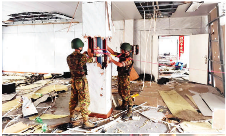
ကရင်ပြည်နယ် မြဝတီခရိုင် ရွှေကုက္ကိုလ်နယ်မြေရှိ အွန်လိုင်းလိမ်လည်လောင်းကစားမှုလုပ်ကိုင်ခဲ့သည့် တရားမဝင် ခုနစ်ထပ် လူနေအဆောက်အအုံကို ယမ်းဖြင့် ဖောက်ခွဲဖျက်ဆီးရန် ပြင်ဆင်နေစဉ်။