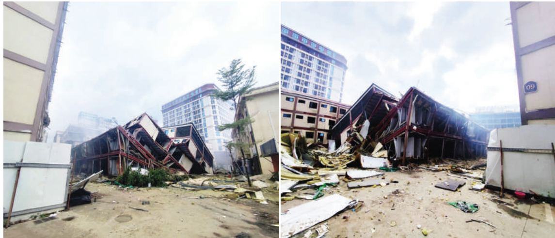
ကရင်ပြည်နယ် မြဝတီခရိုင် ရွှေကုက္ကိုလ်နယ်မြေရှိ အွန်လိုင်းလိမ်လည်လောင်းကစားမှုလုပ်ကိုင်ခဲ့သည့် တရားမဝင် ခုနစ်ထပ် လူနေအဆောက်အအုံကို ယမ်းဖြင့် ဖောက်ခွဲဖျက်ဆီးပြီး မှတ်တမ်းဓာတ်ပုံ။