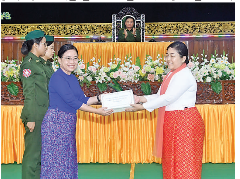
ဒုတိယတပ်မတော်ကာကွယ်ရေးဦးစီးချုပ် ကာကွယ်ရေးဦးစီးချုပ်(ကြည်း) ဗိုလ်ချုပ်ကြီးကျော်စွာလင်း၏ ဇနီး ဒေါ်နန်းကူးကု တပ်နယ်ရှိ မိခင်နှင့်ကလေးစောင့်ရှောက်ရေးအသင်းအတွက် ချီးမြှင့်ငွေများပေးအပ်ရာ တိုင်းမှူး၏ဇနီးကလက်ခံရယူစဉ်။

ရရှိပြီးဖြစ်သော်လည်း အကြမ်းဖက်အဖွဲ့အစည်းများအနေဖြင့် ကိုယ်ကျိုးစီးပွားအတွက် နည်းလမ်းမျိုးစုံကိုအသုံးပြုပြီး တစ်ဖက်နိုင်ငံမှစွန့်ခွာပြီး တရားမဝင်တင်သွင်းခြင်း၊ မိမိနိုင်ငံမှ အဖိုးတန်သယံဇာတများကိုလည်း တစ်ဖက်နိုင်ငံသို့ ခိုးထုတ်လျက်ရှိကြောင်း၊ ထို့ကြောင့် နိုင်ငံတော်ကရရှိမည့် အခွန်အခများ၊ ဘဏ္ဍာများကို များစွာဆုံးရှုံးနစ်နာရကြောင်း၊ ထိုသို့ဆောင်ရွက်ခြင်းများမှ ရရှိလာသည့် ဝင်ငွေများဖြင့် အကြမ်းဖက်လုပ်ငန်းများကို လုပ်ဆောင်နေကြခြင်းဖြစ်ကြောင်း၊ ၎င်းအပြင် အကြမ်းဖက်အဖွဲ့