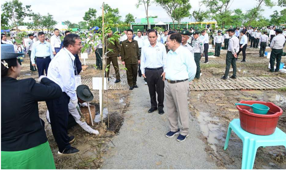
ပြည်ထောင်စုသမ္မတမြန်မာနိုင်ငံတော် နိုင်ငံတော်သမ္မတ ဦးမင်းအောင်လှိုင် ၂၀၂၆ ခုနှစ် မိုးရာသီ နိုင်ငံတော်အဆင့် ဒုတိယအကြိမ် သစ်ပင်စိုက်ပျိုးပွဲတော်အခမ်းအနားသို့တက်ရောက်လာကြသူများက ပျိုးပင်များစိုက်ပျိုးနေမှုကို လှည့်လည်ကြည့်ရှုအားပေးစဉ်။

ရာသီဥတုပြောင်းလဲမှုကို တုံ့ပြန်ဆောင်ရွက်ရာတွင် သစ်တောများနှင့်သဘာဝဂေဟစနစ်များကို ထိန်းသိမ်းကာကွယ်ခြင်းသည် သဘာဝအခြေပြုဖြေရှင်းနည်းများ (Nature-based Solutions) အနက် အလွန်ထိရောက်သည့်နည်းလမ်းတစ်ခုဖြစ်ကြောင်း၊ သစ်တောများသည် လေထုထဲမှ ကာဗွန်ကို စုပ်ယူသိုလျှော့ပေးပြီး ရာသီဥတုပြောင်းလဲ