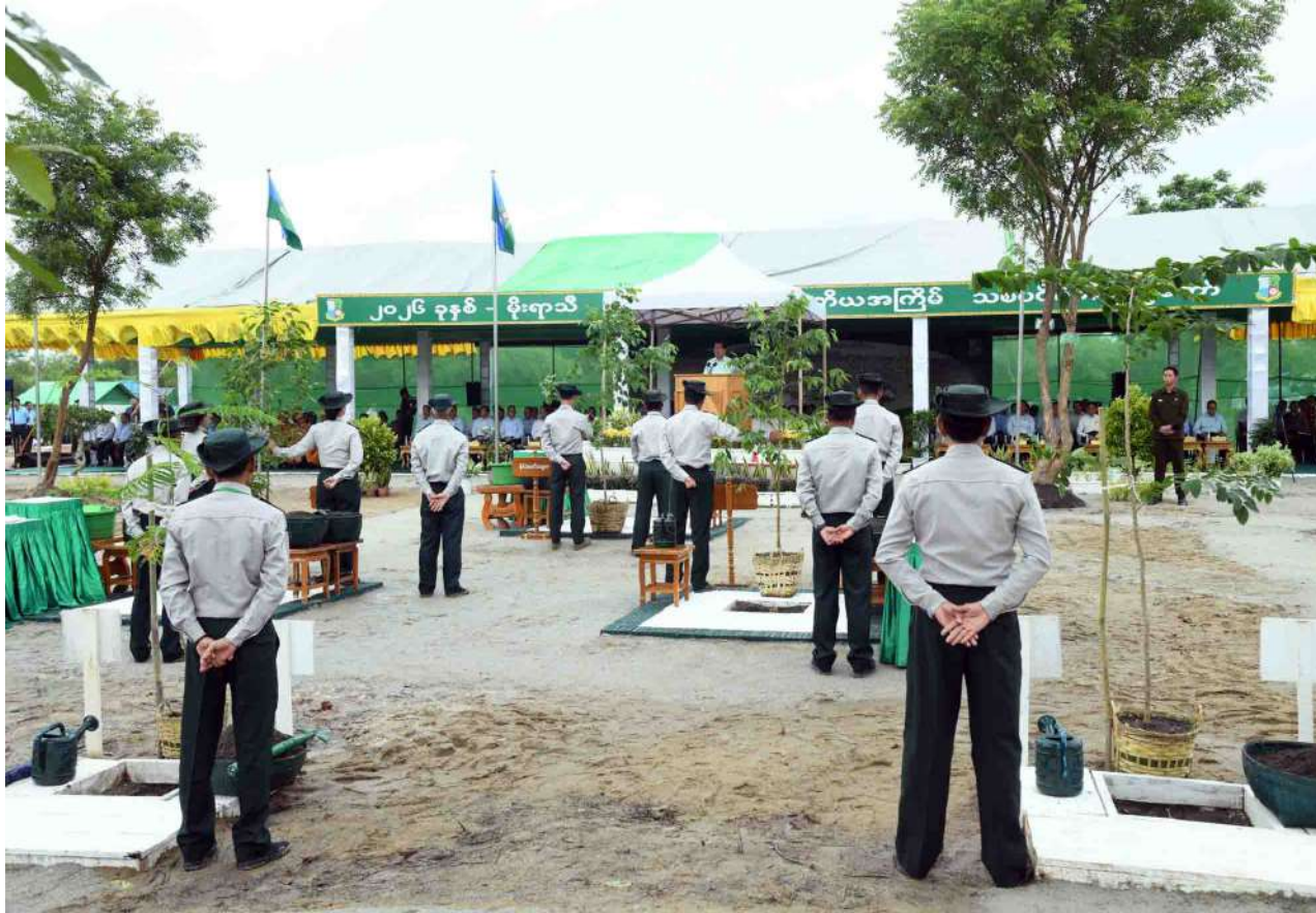
President U Min Aung Hlaing addresses the second national-level monsoon tree-growing ceremony for 2026.