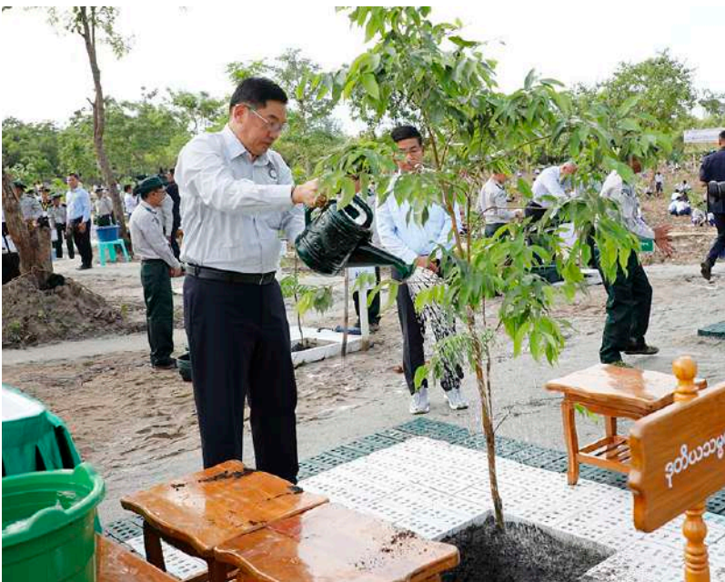
ဒုတိယသမ္မတ ဦးညိုစော ပျိုးပင်ကို စိုက်ပျိုးပေးစဉ်။

ကမ္ဘာ့နိုင်ငံအသီးသီးတွင်ကြုံတွေ့နေရ သည့် သဘာဝပတ်ဝန်းကျင်ပြောင်းလဲမှုများ ကြောင့် Green revolution, Green energy, Green economy စသည်ဖြင့် နိုင်ငံတစ်ဝန်း