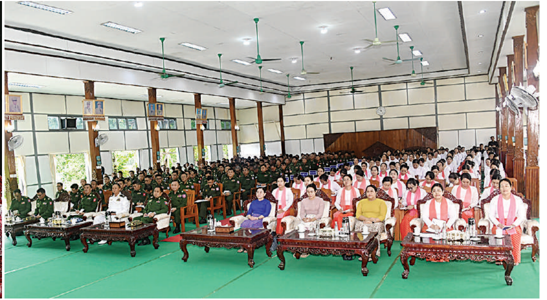
ဒုတိယတပ်မတော်ကာကွယ်ရေးဦးစီးချုပ် ကာကွယ်ရေးဦးစီးချုပ်(ကြည်း) ဗိုလ်ချုပ်ကြီးကျော်စွာလင်း မော်လမြိုင်တပ်နယ်ရှိ အရာရှိ၊ စစ်သည်၊ မိသားစုဝင်များကို တွေ့ဆုံအမှာစကားပြောကြားစဉ်။

နေပြည်တော် ၅ ဇူလိုင် ၂၀၂၆ - ဒုတိယတပ်မတော် ကာကွယ်ရေးဦးစီးချုပ် ကာကွယ်ရေးဦးစီးချုပ်(ကြည်း) ဗိုလ်ချုပ်ကြီးကျော်စွာလင်းသည် ဇနီး ဒေါ်နန်းကူးကု၊ ကာကွယ်ရေးဦးစီးချုပ်ရုံးမှ အဆင့်မြင့်တပ်မတော်အရာရှိကြီးများနှင့် ဇနီးများ၊ အရှေ့တောင်တိုင်းစစ်ဌာနချုပ် တိုင်းမှူး၊ ဗိုလ်မှူးချုပ်သူရဇော်လွင်စိုးနှင့် တာဝန်ရှိသူများလိုက်ပါ၍ ယနေ့ နံနက်ပိုင်းတွင် တိုင်းစစ်ဌာနချုပ်ရှိ အောင်ဆန်းခန်းမ၌ မော်လမြိုင်တပ်နယ်မှ အရာရှိ၊ စစ်သည်၊ မိသားစုဝင်များကိုတွေ့ဆုံ၍ အမှာစကားပြောကြားသည်။