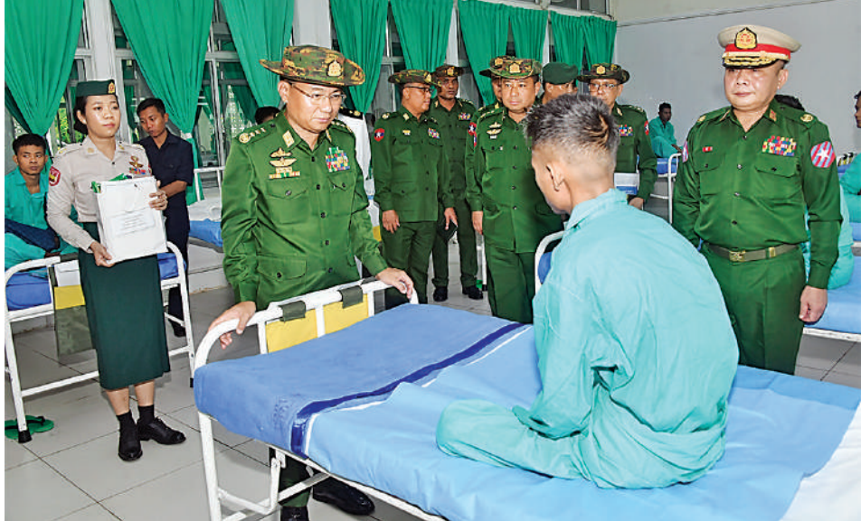
ဒုတိယတပ်မတော်ကာကွယ်ရေးဦးစီးချုပ် ကာကွယ်ရေးဦးစီးချုပ်(ကြည်း) ဗိုလ်ချုပ်ကြီးကျော်စွာလင်း နယ်မြေခံတပ်မတော်ဆေးရုံတွင် တက်ရောက်ဆေးကုသမှုခံယူလျက်ရှိသည့် အရာရှိ၊ စစ်သည်များကို တစ်ဦးချင်း ရင်းရင်းနှီးနှီးမေးမြန်းအားပေးစကားပြောကြားစဉ်။

ဆက်လက်၍ ယနေ့ နေ့လယ်ပိုင်းတွင် ဒုတိယတပ်မတော် ကာကွယ်ရေး ဦးစီးချုပ် ကာကွယ်ရေးဦးစီးချုပ်(ကြည်း) ဗိုလ်ချုပ်ကြီးကျော်စွာလင်းသည် ဇနီး ဒေါ်နန်းကူးကူ၊ ကာကွယ်ရေးဦးစီးချုပ်ရုံးမှ အဆင့်မြင့်တပ်မတော်အရာရှိကြီးများနှင့် ဇနီးများ၊ အရှေ့တောင်တိုင်းစစ်ဌာနချုပ် တိုင်းမှူးနှင့် တာဝန်ရှိသူများလိုက်ပါလျက် မော်လမြိုင်မြို့ရှိ နယ်မြေခံတပ်မတော် ဆေးရုံသို့ရောက်ရှိကြရာ ဆေးရုံတပ်မှူး၊ ပါရဂူများ၊ ဆေးမှူးများနှင့် တာဝန်ရှိ သူများက ကြိုဆိုနှုတ်ဆက်ကြသည်။ ၎င်းနောက် ဒုတိယတပ်မတော် ကာကွယ်ရေးဦးစီးချုပ် ကာကွယ်ရေး ဦးစီးချုပ်(ကြည်း) နှင့်အဖွဲ့ဝင်များသည် မော်လမြိုင်မြို့ နယ်မြေခံတပ်မတော် ဆေးရုံတွင် ဆေးရုံတက်ရောက် ဆေးကုသမှုခံယူလျက်ရှိသည့် အရာရှိ၊ စစ်သည်များ၏ တစ်ဦးချင်းရောဂါ