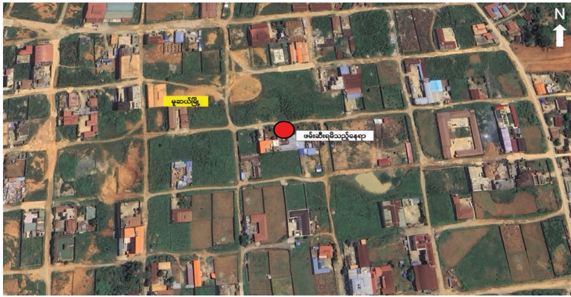
မုဆယ်မြို့အတွင်း အွန်လိုင်းလိမ်လည်လောင်းကစားမှုကျူးလွန်ရာတွင် ပါဝင်ပတ်သက်သူ တရားမဝင် တရုတ်နိုင်ငံသား ခုနစ်ဦးကို လုပ်ငန်းသုံးပစ္စည်းများနှင့်အတူ ဖမ်းဆီးရမိသည့် နေရာပြပုံ။

■ မုဆယ်မြို့မှ အလုံးစုံ အန္တရာယ်ပေးလျက်ရှိသည့် အွန်လိုင်းလိမ်လည်မှုနှင့် အွန်လိုင်းလောင်းကစားမှု တိုက်ဖျက်ရေးလုပ်ငန်းစဉ်များကို အမျိုးသားရေး တာဝန်တစ်ရပ်အဖြစ်ခံယူကာ အလေးထားဆောင်ရွက်လျက်ရှိပြီး ပြည်တွင်းအင်အားစုများအပြင် အိမ်နီးချင်းနိုင်ငံအစိုးရများနှင့်လည်း ပေါင်းစပ်ညှိနှိုင်း၍ စဉ်ဆက်မပြတ် အရှိန်အဟုန်ဖြင့် တင်ပြတ်ပြတ်သားသားနှိမ်နင်းတိုက်ဖျက်လျက်ရှိသည်။ (မြောက်ပိုင်း) မုဆယ်မြို့ ကောင်းမူလွယ်နယ်မြေ ကောင်းမူတုံရပ်ကွက်ရှိ နေအိမ်တစ်လုံးအတွင်းမှ အွန်လိုင်းလိမ်လည်လောင်းကစားမှုကျူးလွန်သူ တရားမဝင် တရုတ်နိုင်ငံသား အမျိုးသား ခုနစ်ဦးကို ဖမ်းဆီးရမိသည့်နေရာ နှစ်စီး၊ Laptop တစ်လုံး၊ဆိုင်ကယ် နှစ်စီး၊ အခြားလုပ်ငန်းသုံး ဆက်စပ်ပစ္စည်းများနှင့်အတူ ဖမ်းဆီးရမိခဲ့သည်။ အဆိုပါ အွန်လိုင်းလိမ်လည်လောင်းကစားမှုများ လုပ်ကိုင်လျက်ရှိသည့် ဖမ်းဆီးရမိသူများကို လိုအပ်သည့် စစ်ဆေးမှုများ ဆောင်ရွက်ပြီးစီးပါက တည်ဆဲဥပဒေများနှင့်အညီ ထိရောက် ပြင်းထန်စွာ အရေးယူဆောင်ရွက်သွားမည်ဖြစ်ပြီး သိမ်းဆည်းရမိသည့် လုပ်ငန်းသုံးပစ္စည်းများကို လုပ်ထုံးလုပ်နည်းများနှင့်အညီ ဆက်လက်ဆောင်ရွက်သွားမည် ဖြစ်ကြောင်း သိရသည်။ နိုင်ငံတော်အနေဖြင့် အွန်လိုင်းလိမ်လည်မှု၊ အွန်လိုင်းလောင်းကစားမှုနှင့် ဒုစရိုက်မှုမှန်သမျှတို့တွင် ပါဝင်ပတ်သက်နေသူများနှင့် နောက်ကွယ်မှ ကြိုးကိုင်