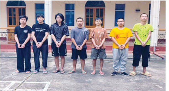
အွန်လိုင်းလိမ်လည်လောင်းကစားမှုကျူးလွန်ရာတွင် ပါဝင် ပတ်သက်သည့် တရားမဝင် တရုတ်နိုင်ငံသား ခုနစ်ဦးကို တွေ့ရစဉ်။

နေပြည်တော် ဇွန် ၂၅ နိုင်ငံတော်အစိုးရအနေဖြင့် ကမ္ဘာတစ်ဝန်းရှိ လူသားမျိုးနွယ်အားလုံး ၏ လူမှုဘဝများကို ထိခိုက်ပျက်စီးစေပြီး အများပြည်သူအကျိုးစီးပွားကို ထိခိုက်ပျက်စီးအောင် စာမျက်နှာ ၂၈ ကော်လံ ၁ ■