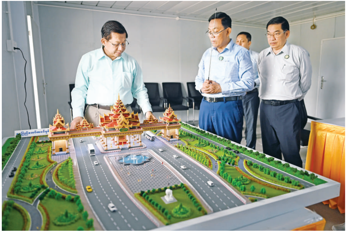
ပြည်ထောင်စုသမ္မတမြန်မာနိုင်ငံတော် နိုင်ငံတော်သမ္မတ ဦးမင်းအောင်လှိုင် နေပြည်တော်မြို့အဝင်မုခ်ဦး(Naypyitaw Gate) ပုံစံငယ်အား ကြည့်ရှုစစ်ဆေးစဉ်။

လုပ်ငန်းခွင်သို့ သွားရောက်ကြည့်ရှု စစ်ဆေးသည်။ ဦးစွာ နိုင်ငံတော်သမ္မတနှင့် အဖွဲ့ဝင် များကို ရှင်းလင်းဆောင်ခန်းမ၌ ဆောက် လုပ်ရေးဝန်ကြီးဌာန ပြည်ထောင်စုဝန်ကြီး ဦးမျိုးသန့်က နေပြည်တော်မြို့အဝင်မုခ်ဦး တည်ဆောက်ရေးလုပ်ငန်းများ ဆောင်ရွက် နေမှုအခြေအနေများနှင့် ပတ်သက်၍ ရှင်းလင်းတင်ပြသည်။ ရှင်းလင်းတင်ပြမှုများအပေါ် နိုင်ငံ တော်သမ္မတက မြို့အဝင်မုခ်ဦး တည် ဆောက်ရာတွင် ဆောက်လုပ်ရေးလုပ်ငန်း ခွင်ကြောင့် ယာဉ်များသွားလာမှုမပျက် စေရေး ရှောင်ကွင်းလမ်း(By Pass)များ စနစ်တကျဖောက်လုပ်ပေးရန်၊ မုခ်ဦးကို မြန်မာမှုလက်ရာများဖြင့် ခမ်းခမ်းနားနား စနစ်တကျတည်ဆောက်သွားရန်၊ လမ်း များကို ထောင့်ချိုးများအနည်းဆုံးဖြင့် တည်ဆောက်သွားရန်၊ မုခ်ဦးအဆောက် အအုံကို ငလျင်ဒဏ်ခံနိုင်စေရေးနှင့် ခိုင်မာလှပ သေသပ်စွာဆောင်ရွက်ရန်၊ အများပြည်သူများ အပန်းဖြေနေရာများ နှင့် ကားရပ်နားရန် နေရာများကိုလည်း စနစ်တကျထည့်သွင်းတည်ဆောက်သွား