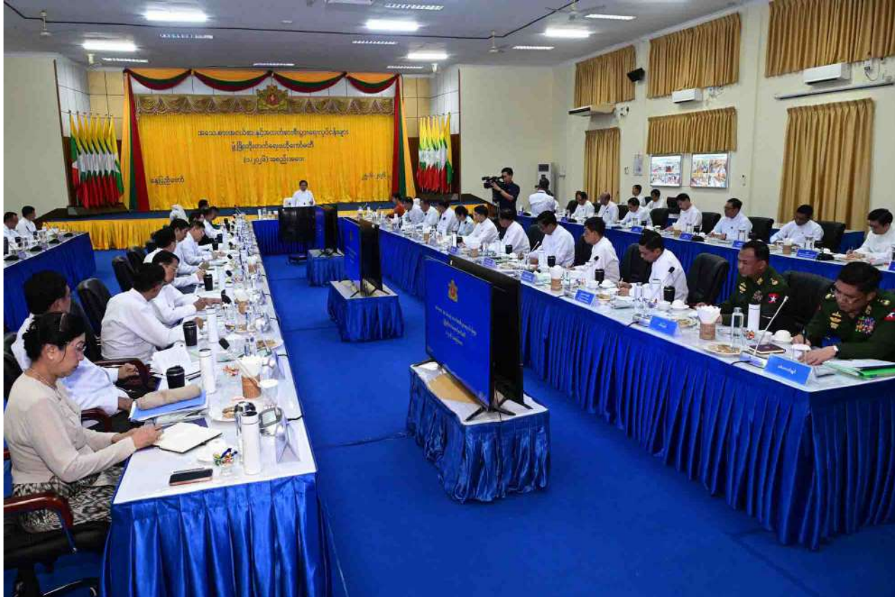
President U Min Aung Hlaing addresses the MSME Development Central Committee meeting.

National economy will definitely develop if efforts are being made with good intentions and a positive mindset for the betterment of the country