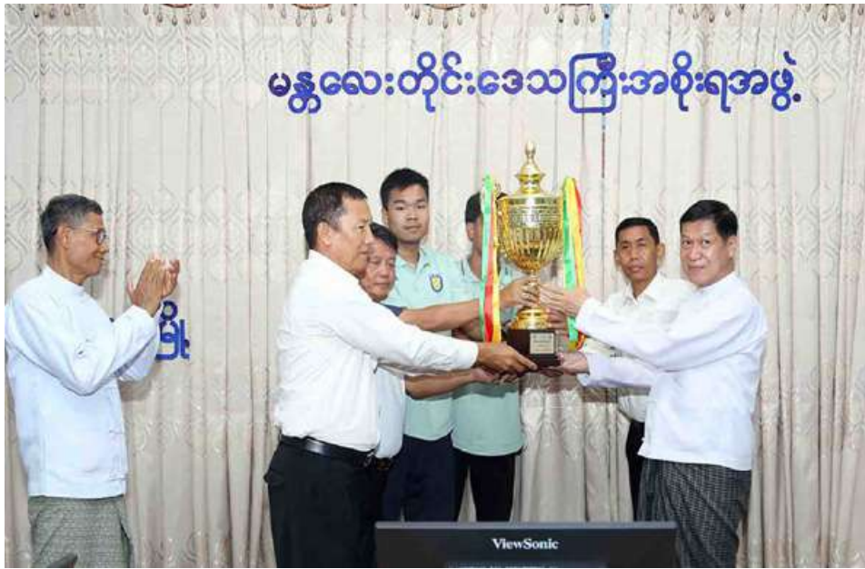
မန္တလေး ဇွန် ၂၃ နှင့်ပြည်နယ် ဘော်လီဘောပြိုင်ပွဲ ရရှိခဲ့သည့်မန္တလေးတိုင်းဒေသကြီး ၂၀၂၆ ခုနှစ် တိုင်းဒေသကြီး တွင် ပထမတံခွန်စိုက်ဆုဖလား အမျိုးသား ဘော်လီဘောအသင်း

နှင့် ဒုတိယဆုရရှိခဲ့သည့် အမျိုးသမီး ဘော်လီဘောအသင်းတို့ကို ကြိုဆိုဂုဏ်ပြုပွဲအခမ်းအနားကို ဇွန် ၂၂ ရက် မွန်းလွဲပိုင်းက မန္တလေးတိုင်းဒေသကြီး အစိုးရအဖွဲ့ရုံး အစည်းအဝေးခန်းမ၌ ကျင်းပခဲ့ကြောင်း သိရသည်။ အခမ်းအနားသို့ မန္တလေးတိုင်းဒေသကြီး ဝန်ကြီးချုပ် ဦးမျိုးအောင်၊ တိုင်းဒေသကြီး ဝန်ကြီးများနှင့် တာဝန်ရှိသူများ၊ တိုင်းဒေသကြီးအားကစားနှင့် ကာယပညာဦးစီးဌာနမှ တာဝန်ရှိသူများ၊ တိုင်းဒေသကြီးဘော်လီဘောဆက်ဆံရေးဦးစီးဌာနနှင့် အဖွဲ့ဝင်များ၊ အုပ်ချုပ်သူနည်းပြများ၊ အောင်ပွဲရ အားကစားသမားများ နှင့် ဖိတ်ကြားထားသူများ တက်ရောက်ကြပြီး အောင်ပွဲရမန္တလေး သိရသည်။ တိုင်းဒေသကြီး ဘော်လီဘောအသင်းမှ အဖွဲ့ခေါင်းဆောင်၊ အုပ်ချုပ်သူ၊ နည်းပြ၊ ကစားသမားများက တစ်ဦးချင်းမိတ်ဆက်ခဲ့ကြကြောင်း သိရသည်။ ဆက်လက်၍ မန္တလေးတိုင်းဒေသကြီး ဝန်ကြီးချုပ် ဦးမျိုးအောင်က ၂၀၂၆ ခုနှစ် တိုင်းဒေသကြီးနှင့်ပြည်နယ် ဘော်လီဘောပြိုင်ပွဲတွင် ပထမတံခွန်စိုက်ဆုဖလားရရှိခဲ့သည့် မန္တလေးတိုင်းဒေသကြီးအမျိုးသားဘော်လီဘောအသင်းနှင့် ဒုတိယဆုရရှိခဲ့သည့် အမျိုးသမီးဘော်လီဘောအသင်းအပေါ် ဂုဏ်ထူးဆောင်နိုင်ခဲ့သည့်အပေါ် ဂုဏ်ပြုစကားများပြောကြားခဲ့ကြောင်း မျိုးကျော်