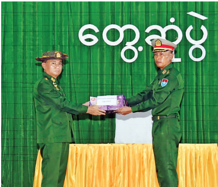
ဒုတိယတပ်မတော်ကာကွယ်ရေးဦးစီးချုပ် ကာကွယ်ရေးဦးစီးချုပ်(ကြည်း) ဗိုလ်ချုပ်ကြီးကျော်စွာလင်း တပ်နယ်မှ အရာရှိ၊ စစ်သည်၊ မိသားစုများအတွက် စားသောက်ဖွယ်ရာများပေးအပ်ရာ တာဝန်ရှိသူတစ်ဦးက လက်ခံရယူစဉ်။

နိုင်ငံတော်တည်ငြိမ်အေးချမ်းရေးကို မလိုလားသည့် အဖွဲ့အစည်းများက နိုင်ငံရေးအကြောင်းပြု၍ ဆူပူအကြမ်းဖက်မှုလုပ်ငန်းများကို လုပ်ဆောင်နေခြင်းကြောင့် တပ်မတော်အနေဖြင့် တည်ငြိမ်အေးချမ်းရေးအတွက် နိုင်ငံအနှံ့လုံး၌ ရေးဆိုင်ရာကိစ္စရပ်များကို ဆောင်ရွက်ပေးနေခြင်းဖြစ်ကြောင်း၊ နိုင်ငံတော်ကို အပြည့်အဝ ကာကွယ်စောင့်ရှောက်နိုင်ရန်အတွက် တပ်မတော်သည် အင်အားတောင့်တင်းခိုင်မာရန်လိုကြောင်း၊ ထိုသို့ အင်အားတောင့်တင်း ခိုင်မာရန်အတွက် တပ်မတော်သားများအနေဖြင့် ခြေလျင်၊ ခြေမြန်၊ လက်ရုံးတပ်ဖွဲ့ဟူ၍ မခွဲခြားဘဲ ပေးအပ်သည့် တာဝန်များကို ကျေပွန်စွာ ထမ်းဆောင်နိုင်ရေးအတွက် အမြဲအသင့်ဖြစ်နေအောင် လေ့ကျင့်နေကြရမည်ဖြစ်ကြောင်း၊ တပ်မတော်သားများအနေဖြင့် သင်တန်းကျောင်းများမှ အဆင့်အလိုက် သင်ကြားပေးလိုက်သည့် စစ်အတတ်ပညာများ၊ စစ်နည်းဗျူဟာများကို