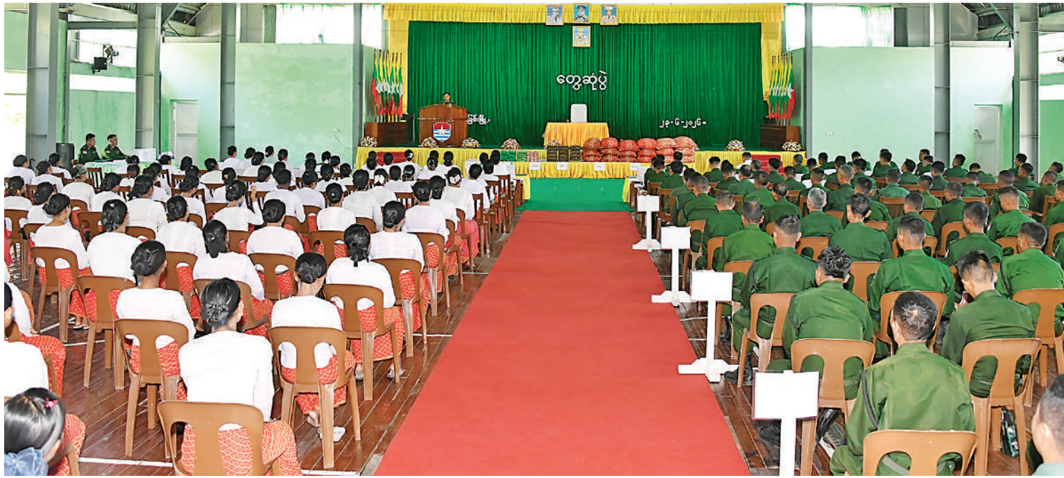
ဒုတိယတပ်မတော်ကာကွယ်ရေးဦးစီးချုပ် ကာကွယ်ရေးဦးစီးချုပ်(ကြည်း) ဗိုလ်ချုပ်ကြီးကျော်စွာလင်း ဘုတ်ပြင်းတပ်နယ်ရှိ အရာရှိ၊ စစ်သည်၊ မိသားစုဝင်များကို တွေ့ဆုံအမှာစကားပြောကြားစဉ်။

နေမှုများကို တပ်မတော်အနေဖြင့် ထိထိရောက်ရောက် ကာကွယ်စောင့်ရှောက်လျက်ရှိကြောင်း။ တပ်မတော်သားများ၏ ပါရမီဖြည့်ဖက် မိသားစုဝင်များအနေဖြင့် ပါရမီဖြည့်ဖက်ကောင်းပီသစွာ ကျင့်ကြံနေထိုင်ကြရန်လိုကြောင်း၊ တပ်မတော်သား မိသားစုဝင်များ၏ ပညာရေးနှင့် ပတ်သက်၍လည်း ပညာရည်မြှင့်တင်ရေး ပိုင်းဆိုင်ရာများကို အစဉ်မပြတ်မြှင့်တင်ပေးလျက်ရှိပြီး မိမိတို့၏ သားသမီးများ၊ မိသားစုဝင်များကို ပညာတတ်များဖြစ်အောင် ပိုင်းဝန်းကြိုးပမ်းဆောင်ရွက်ပေးရမည်ဖြစ်ကြောင်း။ တပ်ရင်း၊ တပ်ဖွဲ့များကို ဦးစီး၊ ဦးဆောင်ပြုလုပ်ရသည့် ခေါင်းဆောင်များသည် မိဘသဖွယ်စိတ်ဓာတ်၊ တပ်မှူးကောင်းသဖွယ် စိတ်ဓာတ်တို့ဖြင့် ကိုယ်စွမ်း၊ ဉာဏ်စွမ်းရှိသူမျိုးကြီးစားကာ