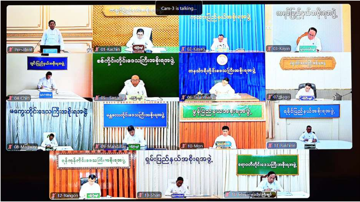
ပြည်ထောင်စုသမ္မတမြန်မာနိုင်ငံတော် ပြည်ထောင်စုအစိုးရအဖွဲ့အစည်းအဝေးသို့ တိုင်းဒေသကြီးနှင့် ပြည်နယ်ဝန်ကြီးချုပ်များက Video Conferencing ဖြင့် တက်ရောက်ကြစဉ်။

ကုန်ထုတ်လုပ်မှုနှင့်ပတ်သက်၍ မိမိတို့နိုင်ငံတွင် ကုန်ထုတ်လုပ်မှုများ အားနည်းနေဆဲပင်ဖြစ်ကြောင်း၊ မိမိအနေဖြင့်ပြီးခဲ့သည့် လဆန်းပိုင်းတွင် အိန္ဒိယသမ္မတနိုင်ငံသို့ တရားဝင်ခရီးစဉ်သွားရောက်ခဲ့ပြီး မကြာမီ ရက်ပိုင်းက တရုတ်ပြည်သူ့သမ္မတနိုင်ငံသို့ နိုင်ငံတော်အဆင့် ခရီးစဉ်သွားရောက်ခဲ့ကြောင်း၊ ထိုသို့ခရီးစဉ်များသွားရောက်စဉ် မိမိတို့နိုင်ငံတွင်ပြည်ပကုန်သွယ်မှုနှင့် ရင်းနှီးမြှုပ်နှံမှုများ ပိုမိုတိုးတက်လာစေရေးစီးပွားရေး လုပ်ငန်းရှင်များနှင့် တွေ့ဆုံဆွေးနွေးခြင်းများဆောင်ရွက်ခဲ့ကြောင်း၊ ထိုသို့ဆောင်ရွက်ခဲ့ခြင်းသည် မိမိတို့နိုင်ငံ၏ ပြည်တွင်းကုန်ထုတ်လုပ်မှုလုပ်ငန်းများ တိုးတက်လာစေရေးအတွက် ဆောင်ရွက်ခဲ့ခြင်းပင်ဖြစ်ကြောင်း၊ ပြည်တွင်း၊ ပြည်ပရင်းနှီးမြှုပ်နှံမှုများ တိုးတက်လာခြင်းဖြင့် အလုပ်အကိုင်များရရှိမည်ဖြစ်သကဲ့သို့ ပြည်တွင်းကုန်ထုတ်လုပ်မှုလုပ်ငန်းများတိုးတက်လာမည်ဖြစ်ကြောင်း၊ ကုန်ထုတ်