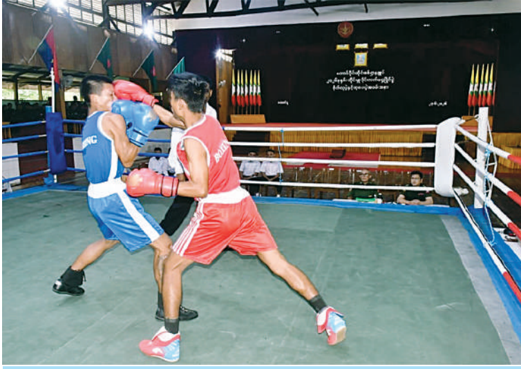
တောင်ပိုင်းတိုင်းစစ်ဌာနချုပ် တိုင်းမှူးခိုင်း လက်ဝှေ့ပြိုင်ပွဲ ဗိုလ်လုပွဲ ပွဲစဉ်ယှဉ်ပြိုင်ကစားနေမှုကို တွေ့ရစဉ်။

နေပြည်တော် ၉ ဇွန် ၂၃ တောင်ပိုင်းတိုင်းစစ်ဌာနချုပ် ၂၀၂၆ ခုနှစ် တိုင်းမှူးခိုင်းလက်ဝှေ့ပြိုင်ပွဲ ဗိုလ်လုပွဲ နှင့် ဆုပေးပွဲကို ယနေ့နံနက်ပိုင်းတွင် တိုင်းစစ်ဌာနချုပ်ရှိ အေးချမ်းဖြိုးခန်းမ၌ ပြုလုပ်ရာ တိုင်းမှူး ဗိုလ်မှူးချုပ်စိုးကျော်ထက် နှင့် တာဝန်ရှိသူများ၊ အရာရှိ၊ စစ်သည်၊ မိသားစုဝင်များ၊ ခိုင်းအဖွဲ့ဝင်များနှင့် ပြိုင်ပွဲဝင်အားကစားသမားများ တက်ရောက်ကြသည်။