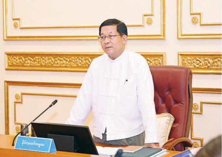
နိုင်ငံတော်သမ္မတ ဦးမင်းအောင်လှိုင် ပြည်ထောင်စုသမ္မတ မြန်မာနိုင်ငံတော် ပြည်ထောင်စု အစိုးရအဖွဲ့ အစည်းအဝေးတွင် အမှာစကား ပြောကြားစဉ်။

နေပြည်တော် ဇွန် ၂၃ ကို ယနေ့မှန်းလွဲပိုင်းတွင် နေပြည်တော်ရှိ နိုင်ငံတော်သမ္မတ ဦးမင်းအောင်လှိုင် အစည်းအဝေးသို့ ဒုတိယသမ္မတများ ကောင်စီဥက္ကဋ္ဌတို့ တက်ရောက်ကြပြီး ပြည်ထောင်စုသမ္မတမြန်မာနိုင်ငံတော် နိုင်ငံတော်သမ္မတရုံးတော် ပြည်ထောင်စု တက်ရောက်အမှာစကား ပြောကြား ဖြစ်ကြသည့်ဦးညိုစောနှင့်ဒေါ်နန်းနီအေး၊ တိုင်းဒေသကြီးနှင့် ပြည်နယ်ဝန်ကြီးချုပ် ပြည်ထောင်စုအစိုးရအဖွဲ့ အစည်းအဝေး အစိုးရအဖွဲ့အစည်းအဝေးခန်းမ၌ ကျင်းပရာ သည်။ ပြည်ထောင်စုဝန်ကြီးများနှင့် နေပြည်တော် များက စာမျက်နှာ ၁၆ ကော်လံ ၁ ပ။