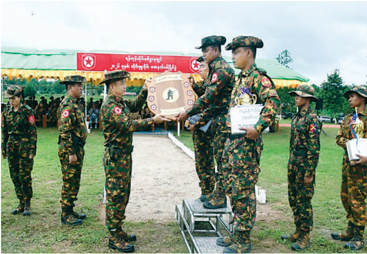
ရန်ကုန်တိုင်းစစ်ဌာနချုပ် တိုင်းမှူး ဗိုလ်မှူးချုပ်တင်မင်းလတ် ခိုင်းဆုရရှိသော အသင်းကို ခိုင်းဆုပေးအပ်ချီးမြှင့်စဉ်။

နေပြည်တော် ၉ ဇွန် ၂၃ တိုက်ကြီးမြို့နယ်ရှိ နယ်မြေခံသင်တန်း ရန်ကုန်တိုင်းစစ်ဌာနချုပ် ၂၀၂၆ ခုနှစ် ကျောင်းနှံပြုလုပ်ရာ တိုင်းမှူး ဗိုလ်မှူးချုပ် တိုင်းမှူးခိုင်း သေနတ်ပစ်ပြိုင်ပွဲ ဗိုလ်လုပွဲ တင်မင်းလတ်နှင့် တာဝန်ရှိသူများ၊ နှင့် ဆုပေးပွဲကို ယနေ့နံနက်ပိုင်းတွင် အရာရှိ၊ စစ်သည်၊ မိသားစုဝင်များနှင့် ရရှိသည်။ (၅၀၁)