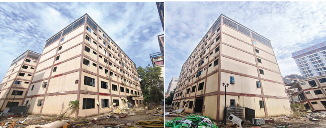
ကရင်ပြည်နယ် မြဝတီခရိုင် ရွှေကုက္ကိုလ်နယ်မြေရှိ အွန်လိုင်းလိမ်လည်လောင်းကစားမှုလုပ်ကိုင်ခဲ့သည့် တရားမဝင် ခုနစ်ထပ် လူနေအဆောက်အအုံ မဖြိုဖျက်မီကို တွေ့ရစဉ်။

ဖျက်ဆီးခဲ့ကြောင်း သိရသည်။ ရွှေကုက္ကိုလ် နယ်မြေအတွင်း၌ အွန်လိုင်းလိမ်လည်လောင်းကစားမှုလုပ်ငန်းများ ကျူးလွန်ရာတွင်အသုံးပြုခဲ့သည့် အဆောက်အအုံ ၇၃ လုံးအနက် ယာဉ်ယန္တရားများဖြင့် ဖြိုချဖျက်ဆီးမည့် အဆောက်အအုံ ၅၇ လုံးနှင့် ဖောက်ခွဲ၍ ဖျက်ဆီးမည့် အဆောက်အအုံ အလုံး ၂၀ ဟူ၍ အဆောက်အအုံအမျိုးအစားအလိုက် ခွဲခြားသတ်မှတ်ပြီး စနစ်တကျဖြိုချဖျက်ဆီးလျက်ရှိရာ ယနေ့တွင် ဖောက်ခွဲ၍ ဖြိုချဖျက်ဆီးရန် သတ်မှတ်ထားသည့် အဆောက်အအုံ အလုံး ၂၀ အနက် ခုနစ်ထပ် လူနေအဆောက်အအုံ တစ်လုံးကို စနစ်တကျ ထပ်မံဖောက်ခွဲဖျက်ဆီးခဲ့ကြောင်း သိရသည်။