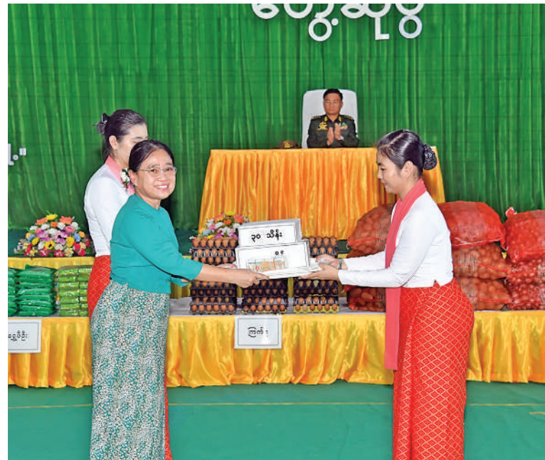
ဒုတိယတပ်မတော်ကာကွယ်ရေးဦးစီးချုပ် ကာကွယ်ရေးဦးစီးချုပ်(ကြည်း) ဗိုလ်ချုပ်ကြီးကျော်စွာလင်း၏ ဇနီး ဒေါ်နန်းကူးကူ တပ်နယ်ရှိ မိခင်နှင့်ကလေးစောင့်ရှောက်ရေးအသင်းအတွက် ချီးမြှင့်ငွေများပေးအပ်ရာ တာဝန်ရှိသူတစ်ဦးက လက်ခံရယူစဉ်။

လက်တွေ့နယ်ပယ်တွင် ကြုံတွေ့ရသည့် အတွေ့အကြုံများနှင့် ပေါင်းစပ်၍ စစ်ဆင်ရေးတာဝန်များတွင် အောင်မြင်အောင် ထမ်းဆောင်ကြရန်လိုကြောင်း၊ အလားတူ တိုးတက်ပြောင်းလဲလျက်ရှိသည့် စစ်အတတ်ပညာများကိုလည်း စဉ်ဆက်မပြတ် လေ့လာနေကြရန်လိုကြောင်း။ တပ်မတော်သားများ ဖြစ်သည့် အတွက် စည်းကမ်းစနစ်တကျဖြင့် ကျင့်ကြံနေထိုင်ကြရန်လိုကြောင်း၊ သို့မှသာ ပေးအပ်လာသည့် အမိန့်နှင့်တာဝန်များကို တစ်ဦးတစ်ယောက်ချင်းမှစ၍ အဖွဲ့အစည်းအလိုက် ကျေပွန်စွာ ထမ်းဆောင်နိုင်မည် ဖြစ်ကြောင်း၊ တပ်မတော်သားများအနေဖြင့် တစ်ဦးချင်း၏ တိုက်စွမ်းရည်များတိုးတက်နေစေရန် အမြဲမပြတ်လေ့ကျင့်ဆောင်ရွက်နေရန်လိုကြောင်း၊ စွမ်းရည်ထက်မြက်သော တပ်မတော်ဖြစ်စေရေးအတွက် တပ်မတော်သားတိုင်း အမိန့်နာခံတတ်မှုရှိပြီး ရဲဘော်စိတ်ဖြင့် ကိုယ်စီတာဝန်များကို ကျေပွန်အောင်ထမ်းဆောင်ကြရန်လိုကြောင်း။ စစ်သည်တစ်ဦးချင်းအလိုက် မိမိတတ်ကျွမ်းရမည့် စစ်အတတ်ပညာများကို ကျွမ်းကျွမ်းကျင်ကျင် တတ်ကျွမ်းအောင် လေ့ကျင့်နေရမည်ဖြစ်ကြောင်း၊ သင်တန်းကျောင်းများက သင်ကြားပေးသည့် စစ်အတတ်ပညာများကို မိမိစစ်ဆင်ရေး