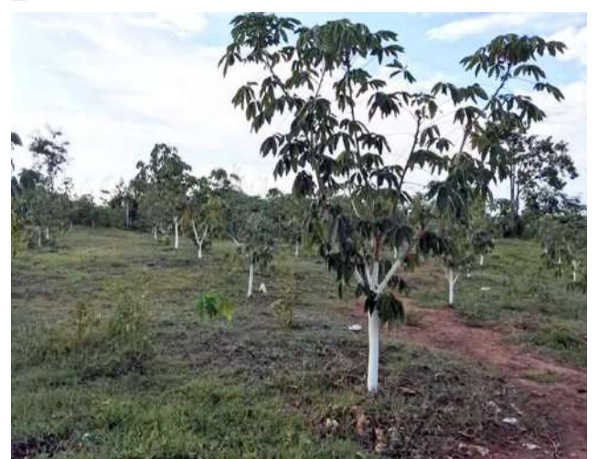
A Sterculia versicolor plantation.

from farms cultivated under GAP methods will be issued GAP certification, and because the crop is produced with reduced chemical use, it is expected to gain stronger market acceptance compared to conventionally grown Sterculia versicolor plants. In addition, the Department of Agriculture will cooperate with the merchants association to help increase Sterculia versicolor yields and improve market access for the crop.