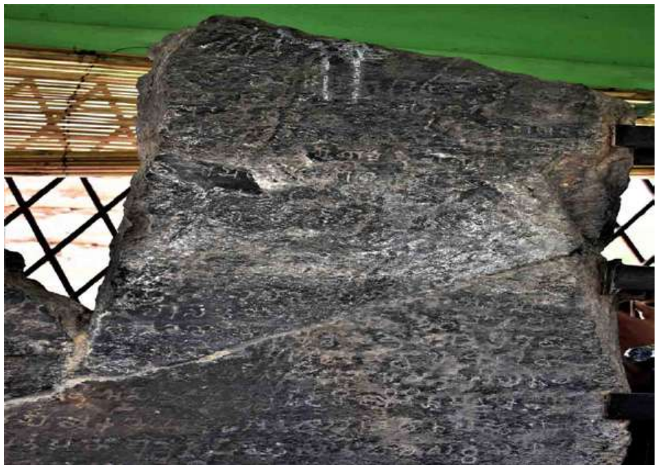
မြစ်သားမြို့ ပေတောပရဟိတကျောင်းတိုက်ရှိ စောလူးမင်းကျောက်စာ

စောလူးမင်းသည် ၁၀၇၇ ခုနှစ်မှ ၁၀၈၄ ခုနှစ်ထိ