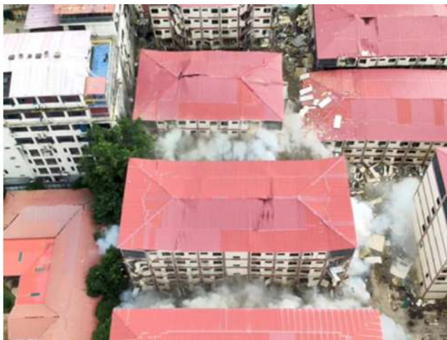
The demolition of the illegal 7-storey residential building in Shwe Kokko, Myawaddy District, Kayin State, which had been used for online scam gambling operations, using explosives.

Nay Pyi Taw June 23 As joint departmental teams are carrying out the complete demolition and destruction of illegal buildings and the systematic destruction of equipment used in operations in the Shwe