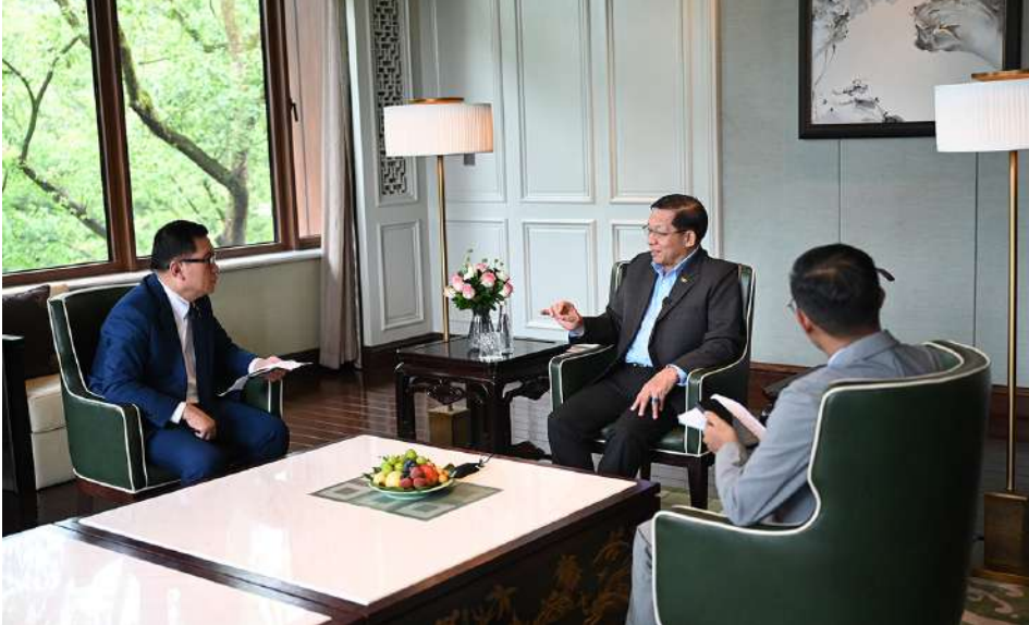
နိုင်ငံတော်သမ္မတ ဦးမင်းအောင်လှိုင် ပြည်တွင်းမီဒီယာများ၏ တွေ့ဆုံမေးမြန်းမှုများကို ဖြေကြားစဉ်။