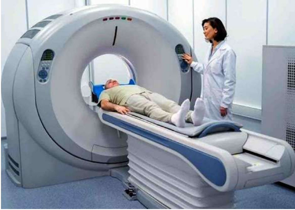
CT Scan ဖြင့် ရောဂါရှာဖွေနေပုံကို တွေ့ရစဉ်။

၂၁ ရာစုသည် နည်းပညာတော်လှန်ရေးခေတ်ဟု ခေါ်ဆိုနိုင်ပြီး ကွန်ပျူတာ၊ အင်တာနက်၊ စမတ်ဖုန်း၊ ဉာဏ်ရည်တု (Artificial Intelligence - AI) နှင့် ဒစ်ဂျစ်တယ်နည်းပညာများသည် လူသားတို့၏ နေ့စဉ်ဘဝကို ပြောင်းလဲပေးလျက်ရှိသည်။ ထိုပြောင်းလဲမှုသည် ကျန်းမာရေးစောင့်ရှောက်မှုကဏ္ဍကိုလည်း အကျိုးသက်ရောက်မှုရှိစေခဲ့သည်။ ယခင်က ရောဂါရှာဖွေရန်၊ ဆရာဝန်နှင့် တိုင်ပင်ရန်၊ စမ်းသပ်စစ်ဆေးမှုများ ပြုလုပ်ရန်အချိန်နှင့် ကုန်ကျစရိတ်များစွာ လိုအပ်ခဲ့သော်လည်း ယနေ့ခေတ်တွင် နည်းပညာ၏အကူအညီဖြင့် ကျန်းမာရေးစောင့်ရှောက်မှုကို ပိုမိုမြန်ဆန်တိကျစေခဲ့သည်။ နည်းပညာသည် ကျန်းမာရေးစောင့်ရှောက်မှုအတွက် အထောက်အကူပြုရုံသာမက လူသားတို့၏ အသက်ရှည်ရေး၊ ဘဝအရည်အသွေးမြင့်မားရေးနှင့် ရောဂါကာကွယ်ရေးတို့အတွက်ပါ အရေးပါလျက်ရှိနေပြီဖြစ်သည်။