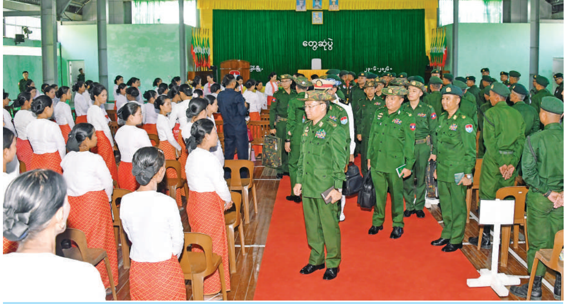
ဒုတိယတပ်မတော်ကာကွယ်ရေးဦးစီးချုပ် ကာကွယ်ရေးဦးစီးချုပ်(ကြည်း) ဗိုလ်ချုပ်ကြီးကျော်စွာလင်း တွေ့ဆုံအမိန့်အစည်းအဝေးသို့ တက်ရောက်လာကြသည့် အရာရှိ၊ စစ်သည်၊ မိသားစုဝင်များကို ရင်းရင်းနှီးနှီးလိုက်လံနူတ်ဆက်စဉ်။

နေပြည်တော် ၇ ဇူလိုင် ၂၀၂၆ ခုနှစ်၊ ဇူလိုင်လ ၁၂ ရက်နေ့၊ ဒုတိယတပ်မတော်ကာကွယ်ရေးဦးစီး ချုပ် ကာကွယ်ရေးဦးစီးချုပ်(ကြည်း) ဗိုလ်ချုပ်ကြီးကျော်စွာလင်းသည် ဇနီး ဒေါ်နန်းကူးကူ၊ ကာကွယ်ရေးဦးစီးချုပ်ရုံးမှ အဆင့်မြင့်တပ်မတော်အရာရှိကြီးများနှင့် ဇနီးများ၊ ကမ်းရိုးတန်းဒေသတိုင်းစစ်ဌာန ချုပ် တိုင်းမှူး၊ ဗိုလ်ချုပ်ကျော်ဟန်နှင့် တာဝန်ရှိသူများလိုက်ပါ၍ ယနေ့မုန်းလွဲ ပိုင်းတွင် ဘုတ်ပြင်းတပ်နယ်ရှိ တပ်နယ် ခန်းမ၌ အရာရှိ၊ စစ်သည်၊ မိသားစုဝင်များ ကို သွားရောက်တွေ့ဆုံအမှာစကားပြော ကြားသည်။ ဦးစွာ ဒုတိယတပ်မတော်ကာကွယ် ရေးဦးစီးချုပ် ကာကွယ်ရေးဦးစီးချုပ် (ကြည်း) ဗိုလ်ချုပ်ကြီးကျော်စွာလင်းက စာမျက်နှာ ၂၁ ကော်လံ ၁ ✪