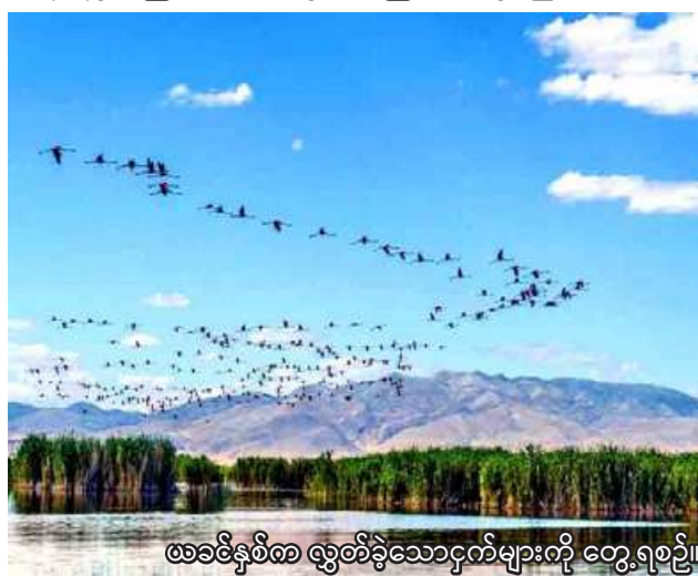
ဖေဖော်ဝါရီလ ဇွန်လအတွင်း ငှက်များကို တွေ့ရမည်။