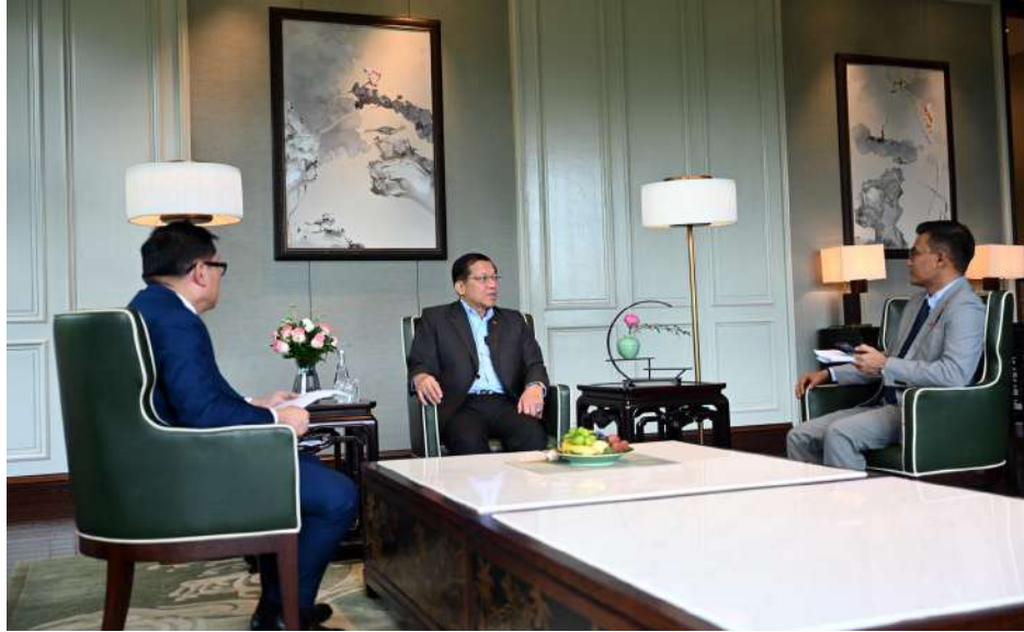
President U Min Aung Hlaing replies to queries raised by local media.