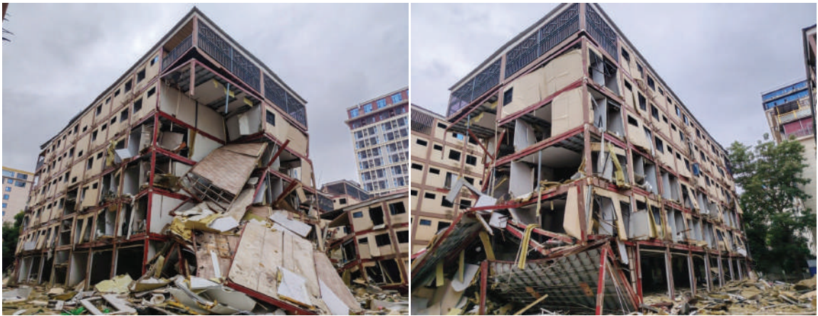
ကရင်ပြည်နယ် မြဝတီခရိုင် ရွှေကုက္ကိုလ်နယ်မြေရှိ အွန်လိုင်းလိမ်လည်လောင်းကစားမှုလုပ်ကိုင်ခဲ့သည့် တရားမဝင် ခုနစ်ထပ် လူနေအဆောက်အအုံ ယမ်းဖြင့် ဖောက်ခွဲဖျက်ဆီးပြီး မှတ်တမ်းဓာတ်ပုံ။

နေပြည်တော် ၅ ဇူလိုင် - အွန်လိုင်းလိမ်လည် လောင်းကစားမှုများကို အခြေချလုပ်ကိုင်ခဲ့ကြသည့် ကရင်ပြည်နယ် မြဝတီခရိုင် ရွှေကုက္ကိုလ်နယ်မြေနှင့် KK Park နယ်မြေများရှိ တရားမဝင် အဆောက်အအုံများကို အပြီးတိုင်ဖြိုချ ဖျက်ဆီးခြင်းများနှင့် လုပ်ငန်းလုပ်ဆောင်ရာတွင် အသုံးပြုခဲ့သည့် ပစ္စည်းများကို စနစ်တကျဖျက်ဆီးခြင်းများကို ဌာနဆိုင်ရာပူးပေါင်းအဖွဲ့များဖြင့် ဆောင်ရွက်လျက်ရှိရာ ယနေ့တွင် ရွှေကုက္ကိုလ်နယ်မြေအတွင်းရှိ တရားမဝင် ခုနစ်ထပ် လူနေအဆောက်အအုံ တစ်လုံးကို ထပ်မံ၍ စနစ်တကျဖောက်ခွဲဖြိုချ