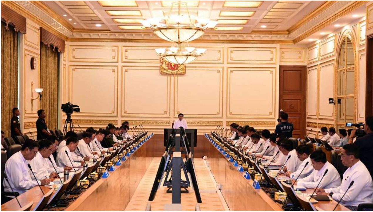
President of the Republic of the Union of Myanmar U Min Aung Hlaing delivers an address at the Union government meeting.