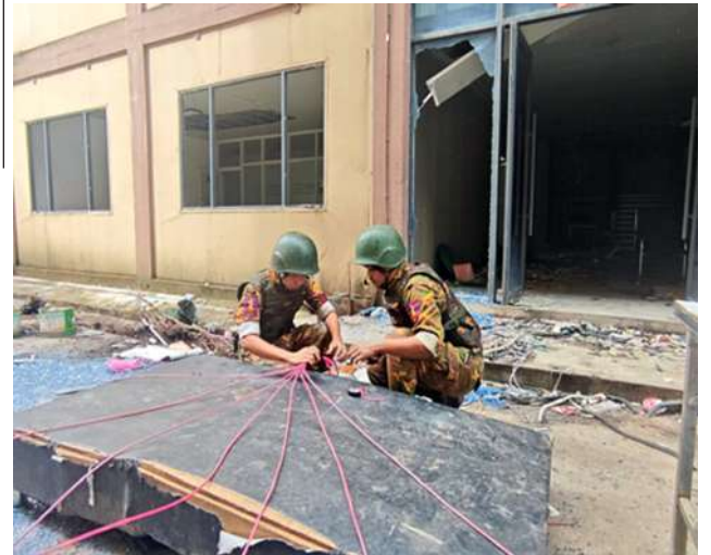
Preparing to demolish the illegal 7-storey residential building in Shwe Kokko, Myawaddy District, Kayin State, which had been used for online scam gambling operations, using explosives.